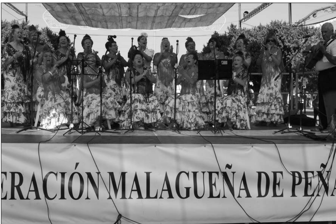
Uno de los coros participantes en el escenario de las peñas en la Feria de 2013.