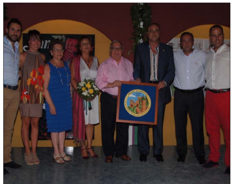
Entrega del Premio La Alcazaba 2013 a Halcón Viajes.