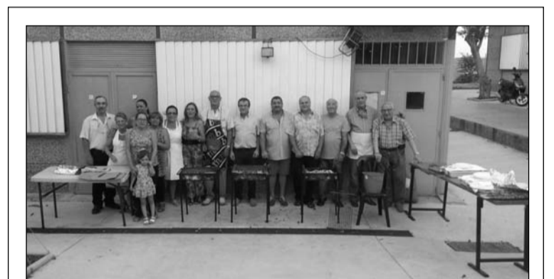
La terraza de la Peña La Biznaga acogió el pasado 2 de agosto su tradicional Pinchitada de Verano, que supuso un éxito de participación entre los socios de esta entidad federadas.