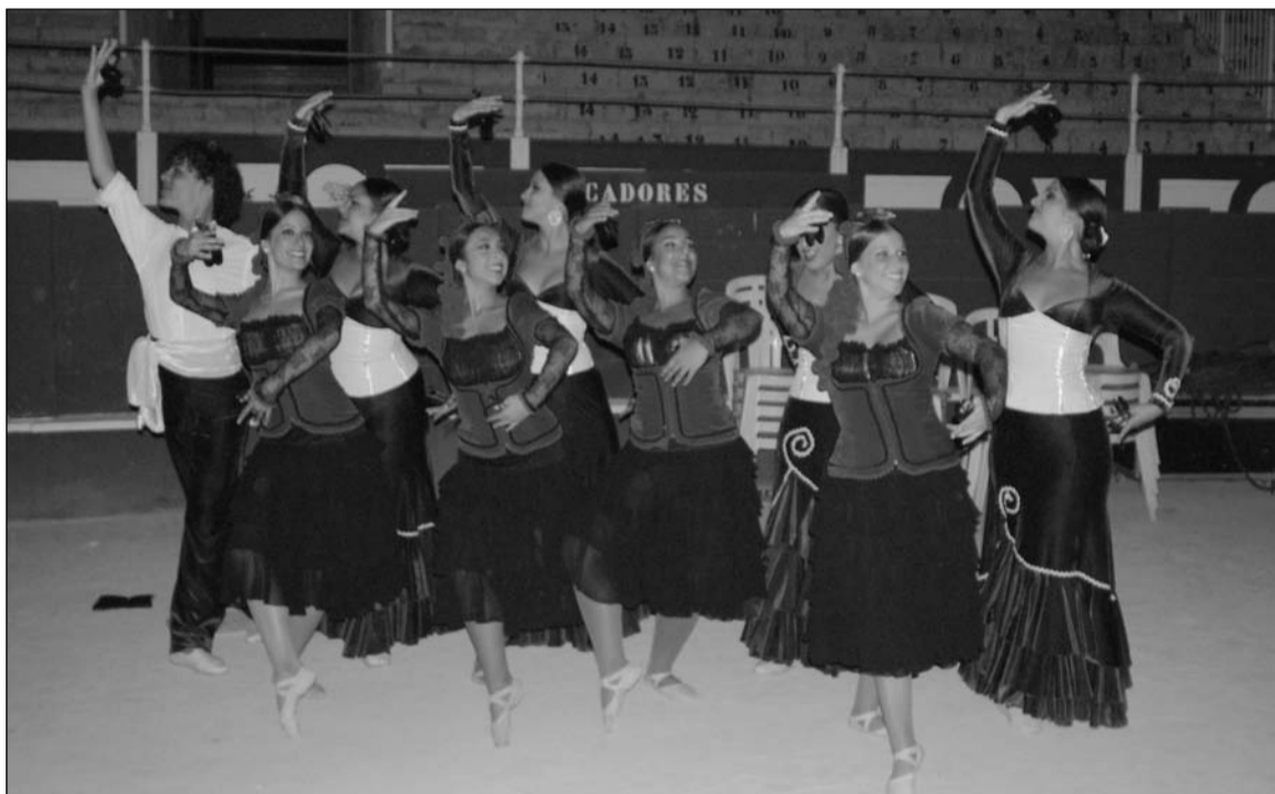
Un grupo baila Malagueñas sobre el albero de La Malagueta.