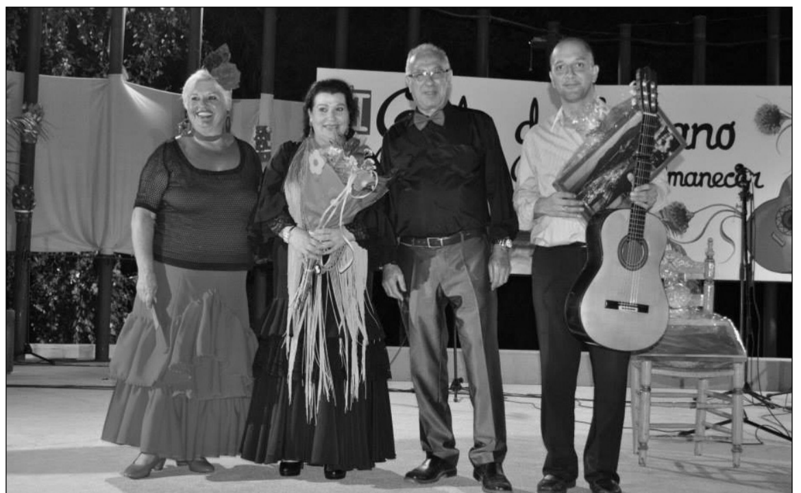
Gala celebrada recientemente por la Asociación Cultural Amanecer.

Más reciente es la incorporación de la Asociación Amanecer de Alhaurín de la Torre, que viene a sumar a las grandes iniciativas culturales que vienen desarrollando desde hace años otros colectivos de su municipio; mientras que la Asociación Cultural Recreativa Las Columnas ha sido la primera entidad de esta zona de la provincia que ingresa en la Federación.