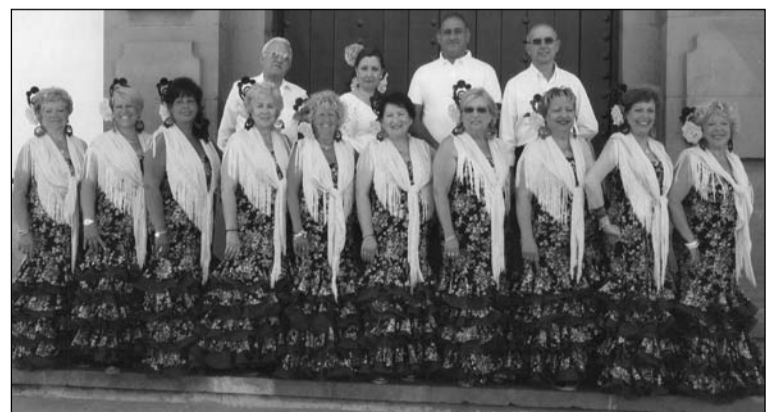
Componentes del Coro Jazmines Malagueños.

El martes día 19 se celebrará en la sede una fiesta, y el día 20 cantarán en las casetas de la Peña Los Ángeles y la Peña Simpatía La Luz; mientras que el viernes día 22 se celebrará en esta misma caseta una noche dedicada a la Peña El Seis Doble.