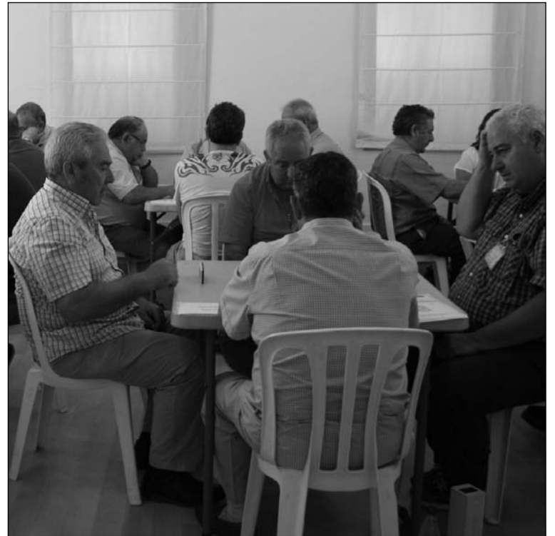
Imagen de la competición de dominó.

Sin embargo, a diferencia de lo que había venido sucediendo cada año anterior, a la finalización de las competiciones no se procedió a la entrega de trofeos,