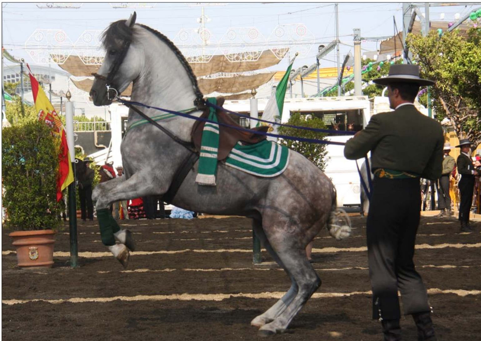
Espectáculo ecuestre celebrado el pasado año en el Real.