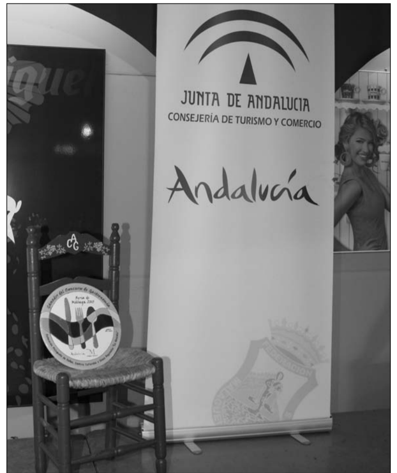
El premio de Gastronomía 2014 espera a su dueño.

La gastronomía es un pilar fundamental de la oferta que cada año ofrece la Feria de Málaga a todos los turistas que visitan la Costa del Sol, ofreciendo la mejor cocina tradicional en un entorno en el que prima la música popular y el ambiente festivo, donde las degustaciones gratuitas se entremezclan con las actuaciones de coros y grupos de baile.