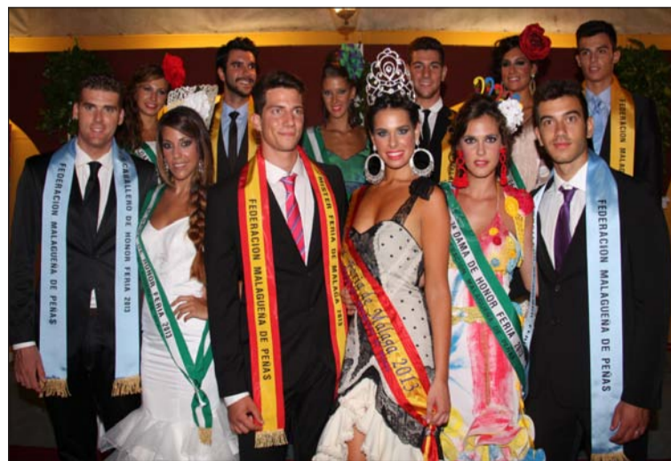
Ganadores del certamen del pasado año.