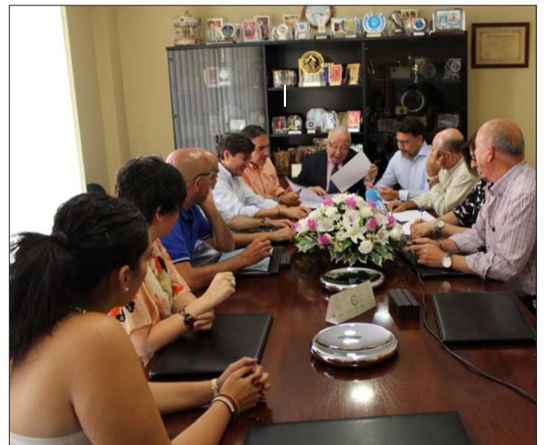
Reunión mantenida en la sala de juntas de la Federación.