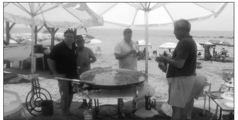
Preparativos de la fideuá en la misma arena de la playa.

fideuá con la que agasajó a sus socios el pasado fin de semana. Se repartieron más de 150 raciones en un día de confraternización.