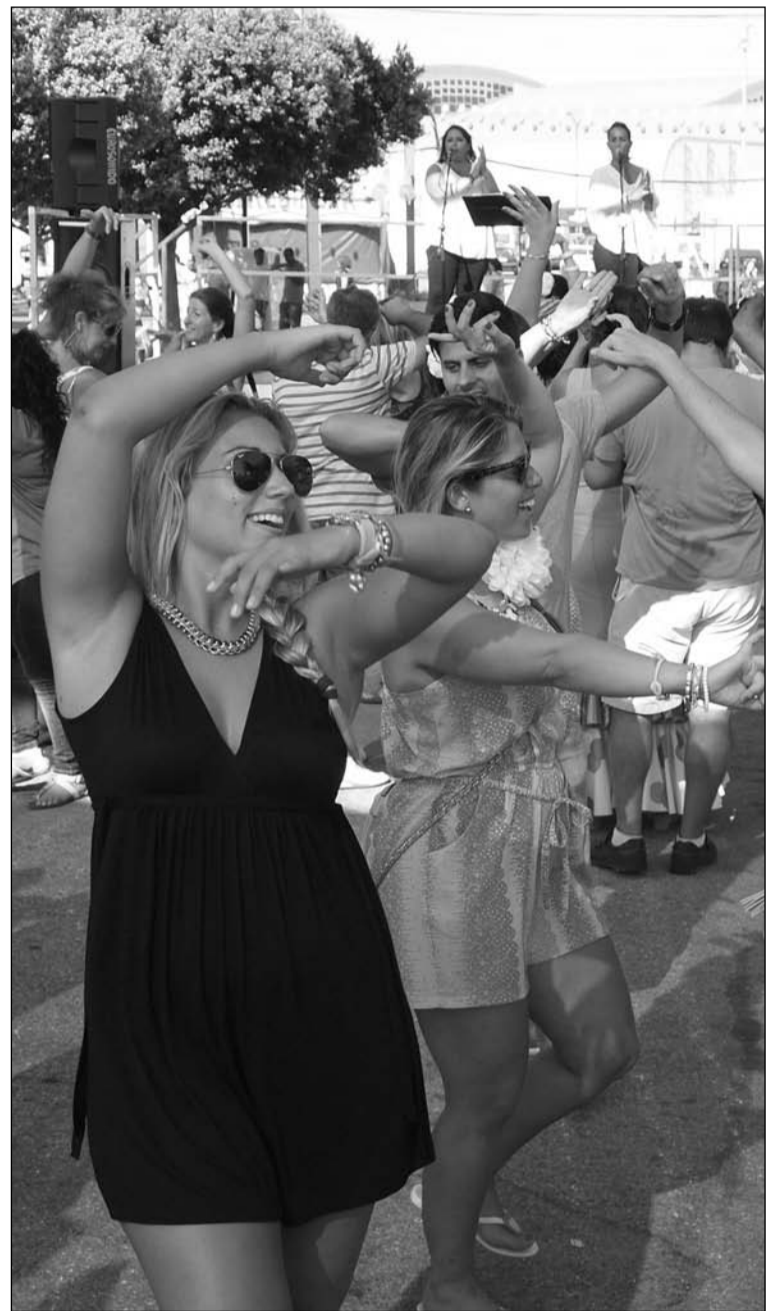
Jóvenes bailando en el escenario instalado junto a la caseta de La Alcazaba.

Cinco agrupaciones entre las que están 'Los Mihitas', 'Sí o Ké', 'Calipso' y 'Los que faltaban' van a actuar el domingo 17 primero, en torno a las 14:30 horas, en el escenario situado en el exterior de la caseta de la Federación de Peñas, y a las 16 horas en la Caseta del Parral. El martes 19, por su parte, volverán a actuar en casetas peñistas. Ese día se entregarán unos premios dotados con 1.000, 700, 500, 300 y 200 euros respectivamente.