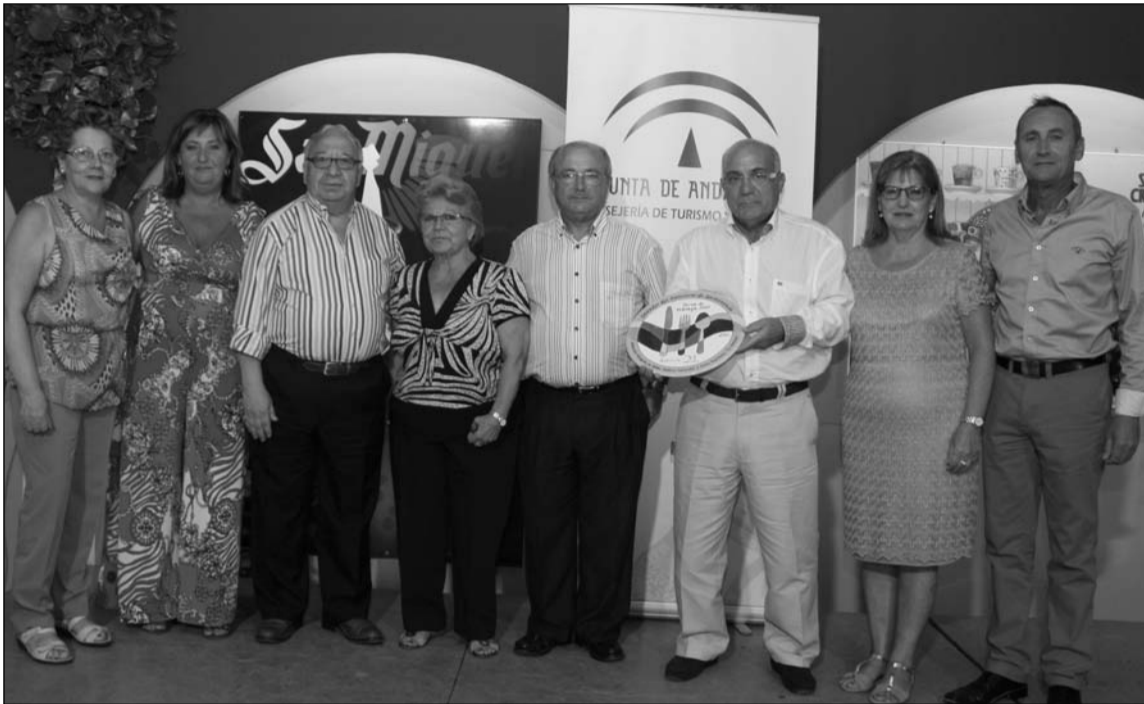
Entrega de premios en la edición anterior.