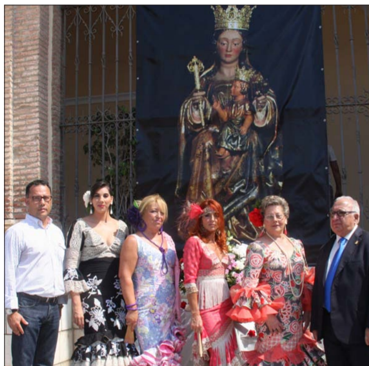
Ofrenda floral del colectivo peñista a la Patrona en 2013.

Entidades colaboradoras con esta publicación: