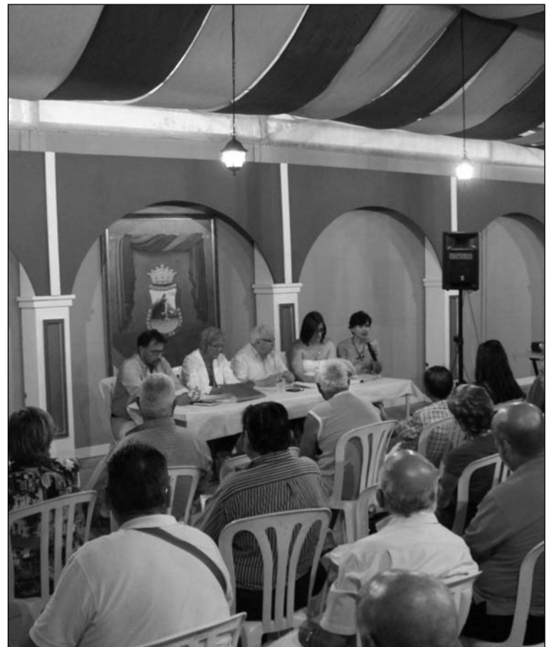
Numerosos presidentes acudieron a la reunión.

Esa misma noche del miércoles 30 de julio mantenía un encuentro informativo en la caseta de La Alcazaba, en la calle Peñista Rafael Fuentes Aragón, en la que se explicaban numerosos detalles relacionados con esta feria y se resolvían las dudas planteadas por los peñistas.