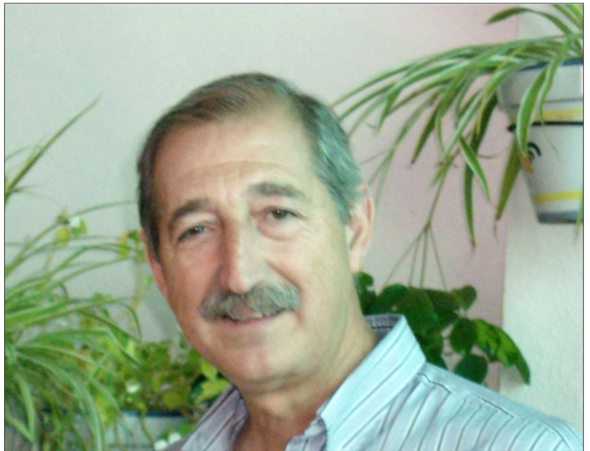
El presidente de la entidad, en una imagen de archivo.

A.C.- Es algo complicado. Creo que el mayor problema actual es la falta de renovación, porque nos falta un relevo. Esperemos que haya un nuevo movimiento entre los jóvenes, aunque parece complicado desde las peñas darles a los jóvenes lo que demandan hoy en día.