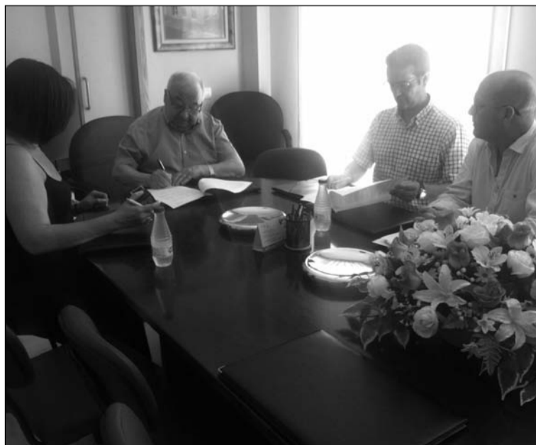
Instante de la rúbrica.

Al igual que la Federación de Peñas, diversas entidades pertenecientes a este colectivo también han facilitado a Vodafone la mejora de su cobertura de internet en el real de la feria.