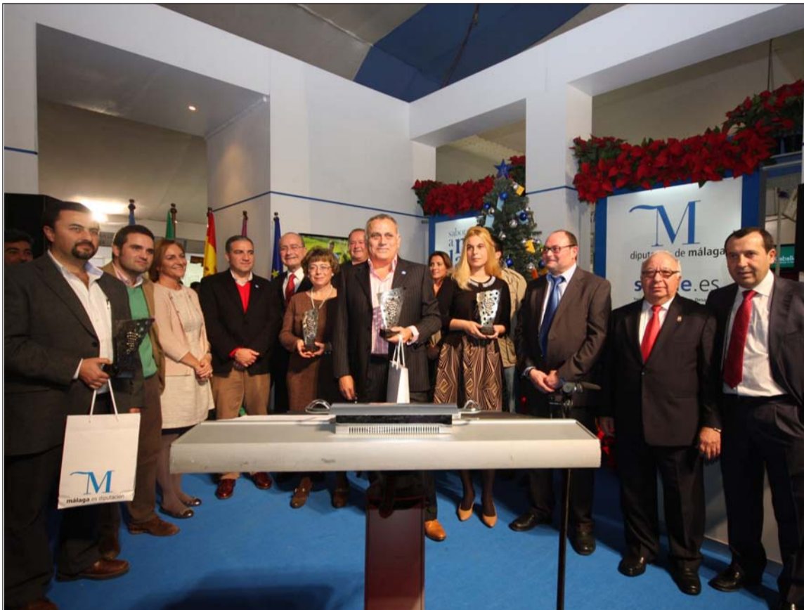
Feria de Sabor a Málaga en La Malagueta el pasado mes de diciembre, con la colaboración de la Federación de Peñas.