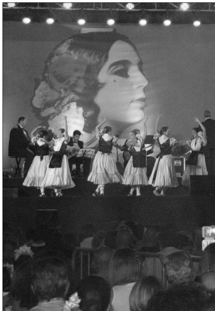
El Certamen de Malagueñas de este año.

de Fiesta que recientemente celebraba su gran final en la Plaza de Toros de La Malagueta. De hecho, como es habitual, desde el Área de Fiestas del Ayuntamiento de Málaga se ha editado un trabajo discográfico con las malagueñas finalistas. Este CD será distribuido gratuitamente entre todas las entidades federadas con case-