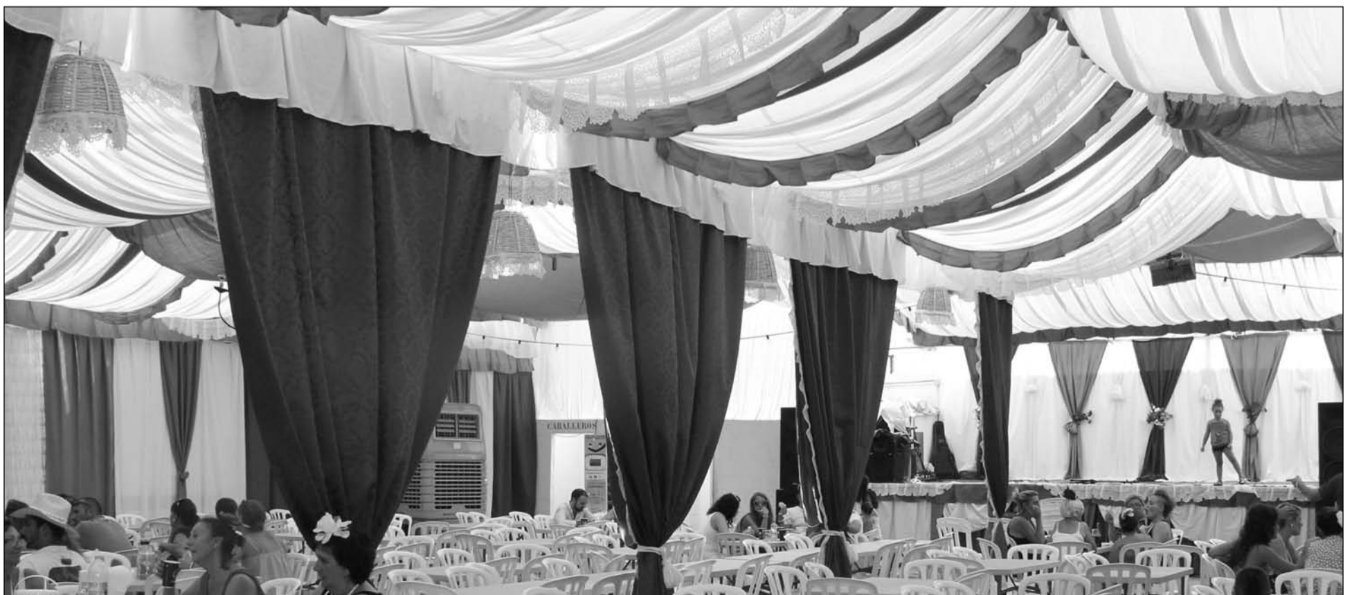
Interior de la caseta de la Peña Los Corazones, ganadora en 2013.