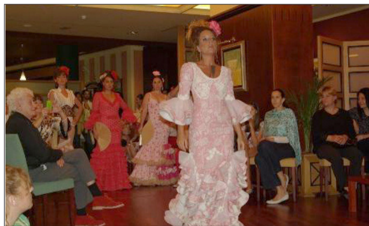
Vestidos de flamencos.