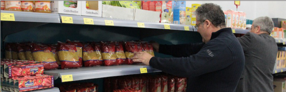
Imagen de archivo del economato de la Fundación Corinto.