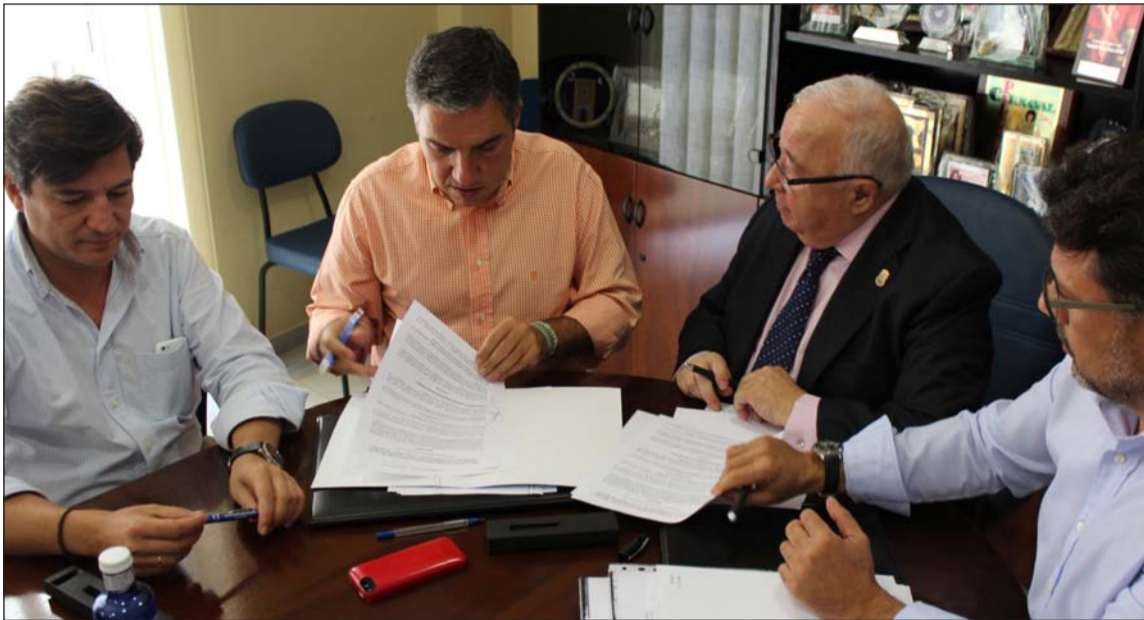
Instante de la firma del acuerdo.