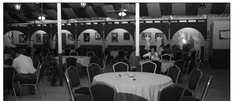
Interior de la caseta La Alcazaba en una edición anterior de la Feria.

novedad, la caseta del colectivo peñista va a acoger en la tarde del miércoles y el jueves una merienda con la colaboración del Área de Participación Ciudadana con la participación de niños de familias en riesgo de exclusión social.