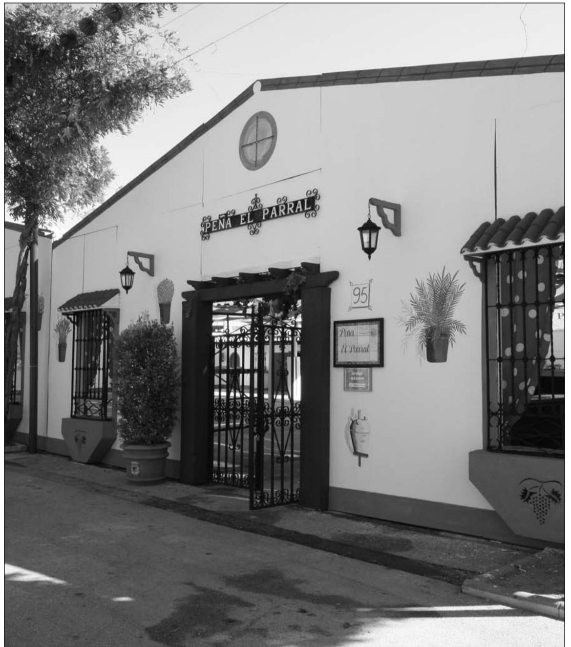
La Peña El Parral obtuvo el primer premio de exteriores en 2013.

Estos premios se conceden gracias al patrocinio de diferentes empresas colaboradoras con este colectivo. De este modo, las relativas a interiores son entregados por Cervezas Victoria, Tesesa y Diario Sur; mientras que las de fachadas corresponden a Cafés Santa Cristina, Coca Cola y Vulcanizados San Martín, respectivamente.