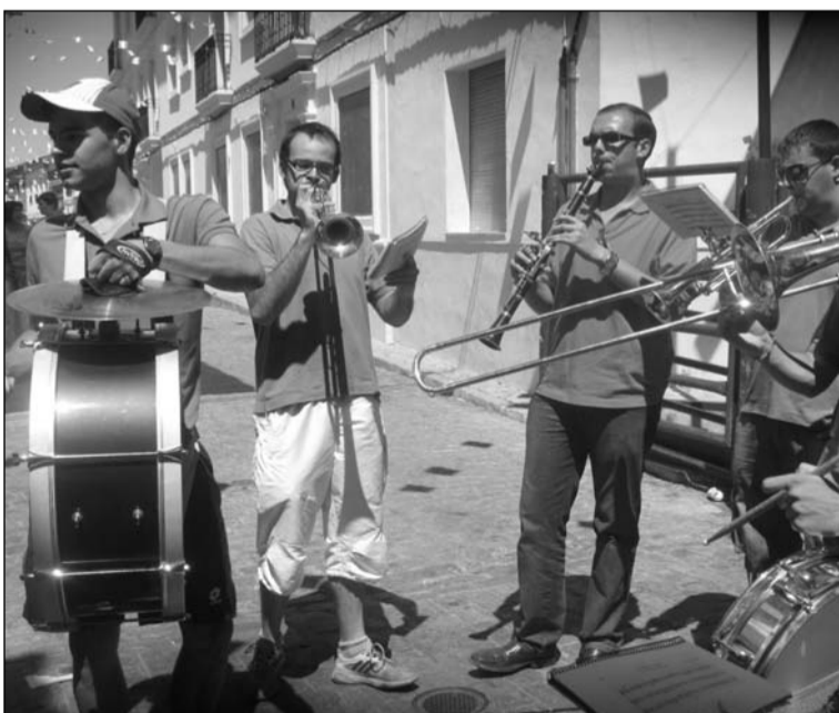
Una charanga anima unas fiestas.