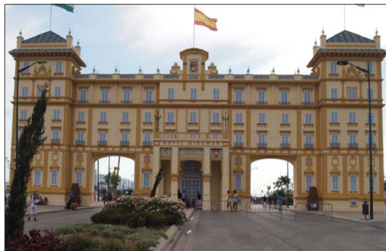
La portada de la Feria acogerá la elección.

Los días previos, sábado y domingo, serán muy intensos, ya que se celebrarán numerosas elecciones en las casetas de muchas de las peñas que aún no han definido a sus representantes. Así, es preciso que todos los participantes acudan en representación de Peñas, Centros Culturales, Casas Regionales, Hermandades, Asociaciones de Vecinos o a cualquier otra asociación debidamente reconocida. No podrán participar las señoritas que con anterioridad hayan obtenido el título