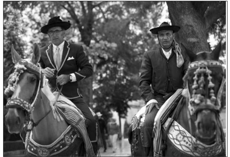
Dos caballistas montan a la usanza rondeña.

También se advierte una falta de indumentaria tradicional malagueña por las calles y paseos de la ciudad, como los trajes de rondeñas, de boleras para fiestas o de perche-leras que hemos podido apreciar en el libro de Juan Navarro, 'Indumentaria Tradicional y de Usanza de Andalucía', en el cual se recogen una gran variedad de atuendos andaluces del siglo XIX, incluidos