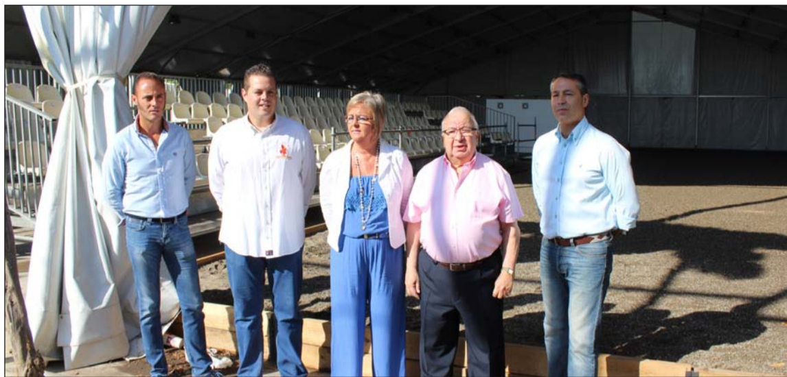
Se ha creado un Centro de Exhibición Ecuestre en Cortijo de Torres.

plataforma del Ayuntamiento. Esta plataforma permite hacer webs muy dinámicas e integradas con redes sociales. En esta página aparecerán todas las noticias relacionadas con la feria, con un apartado para visualizar los mensajes de Twitter del Ayuntamiento, de Onda Azul y Turismo. Hay un apartado titulado: 'Sigue la feria en directo con...Onda Azul', que conecta con toda la información de radio y televisión en directo y a la carta de Onda Azul. También contiene una galería de fotos de la feria (conectada con red social Flickr del Ayuntamiento de Málaga) y de vídeos (Youtube).