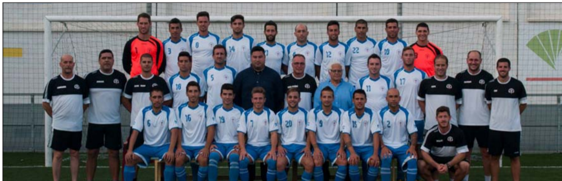
Plantilla del C.D. El Palo en la pasada temporada.