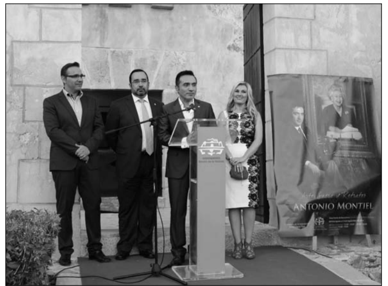
Inauguración de la exposición.