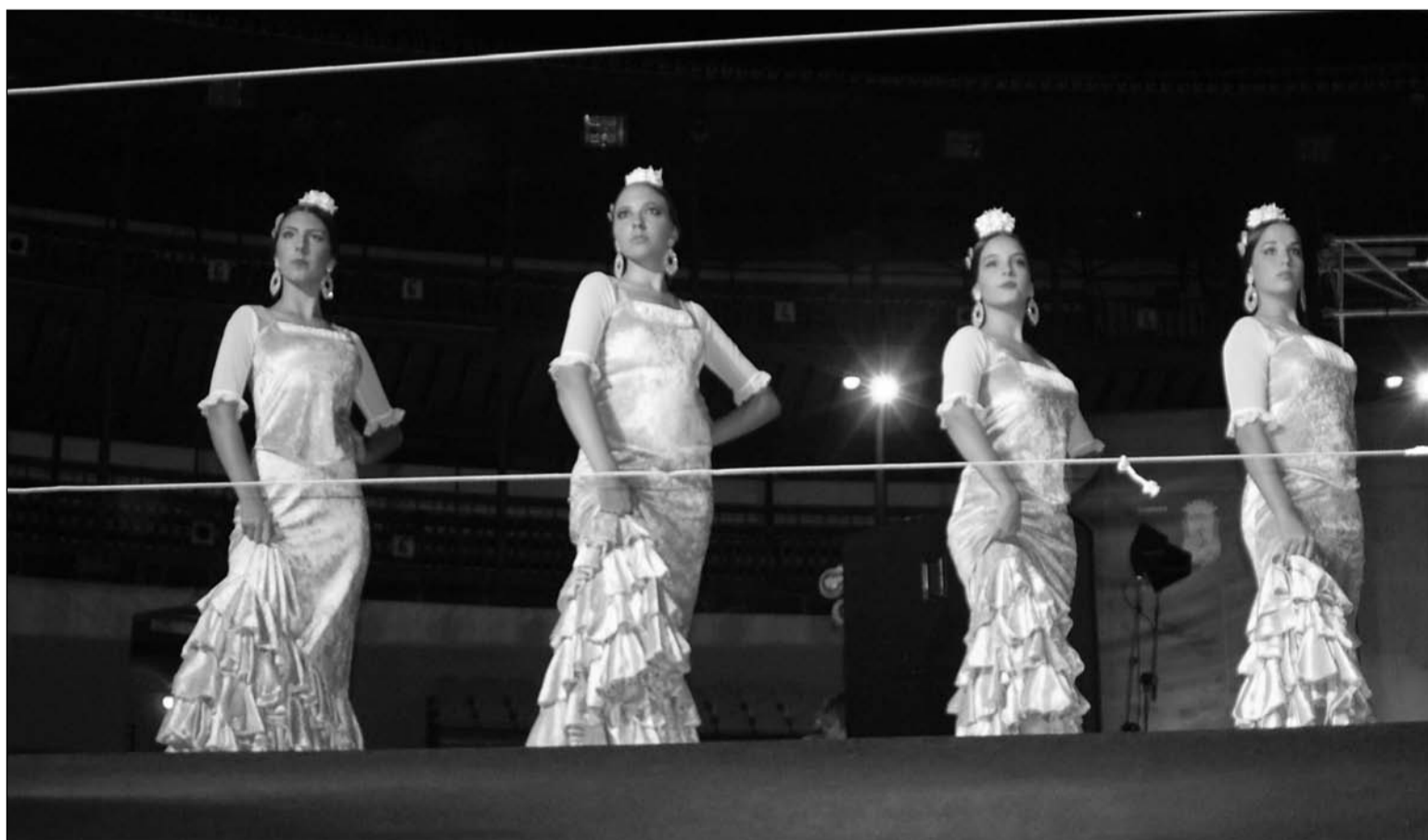
Componentes de un grupo de baile,