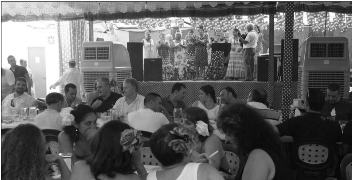
Actuación en la caseta de una de las entidades federadas.

Precisamente en este sentido, desde la propia Federación Malagueña de Peñas se pretende incentivar que la Feria de Málaga mantenga su idiosincrasia de fiesta andaluza; entregando un año más su premio de Ambientación, que se fallará el lunes 18 en el transcurso de la elección de la Reina y el Mister de esta Feria de 2014. El galardón consiste en una placa cerámica donada por Halcón Viajes.