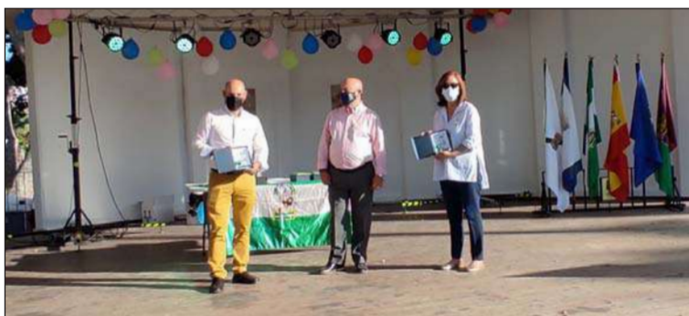
Agradecimiento a los miembros del jurado.