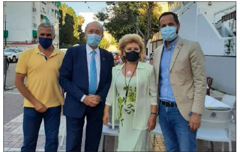
El alcalde y otras autoridades acompañaron a la Peña La Paz el 23 de junio.