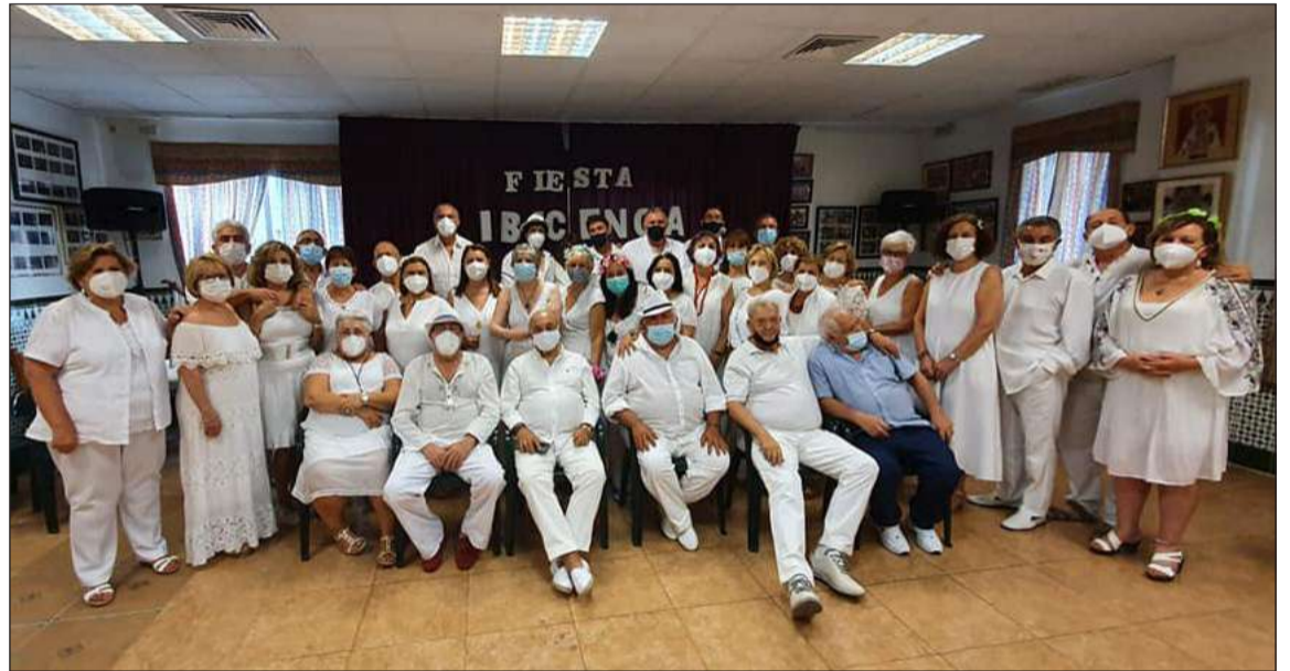
Asistentes a la Fiesta Ibicenca, entre los que se encontraba el presidente de la Federación Malagueña de Peñas.

dad integrada en la Federación Malagueña de Peñas, Centros Culturales y Casas Regionales 'La Alcazaba' acogía el 19 de junio una Fiesta Ibicenca en la que todos los asistentes vistieron de blanco.