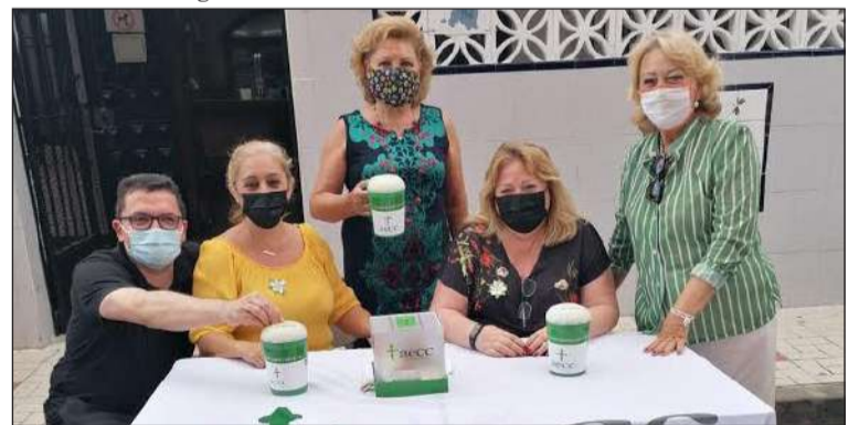
Peña La Paz.