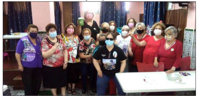
Peña Santa Marta.