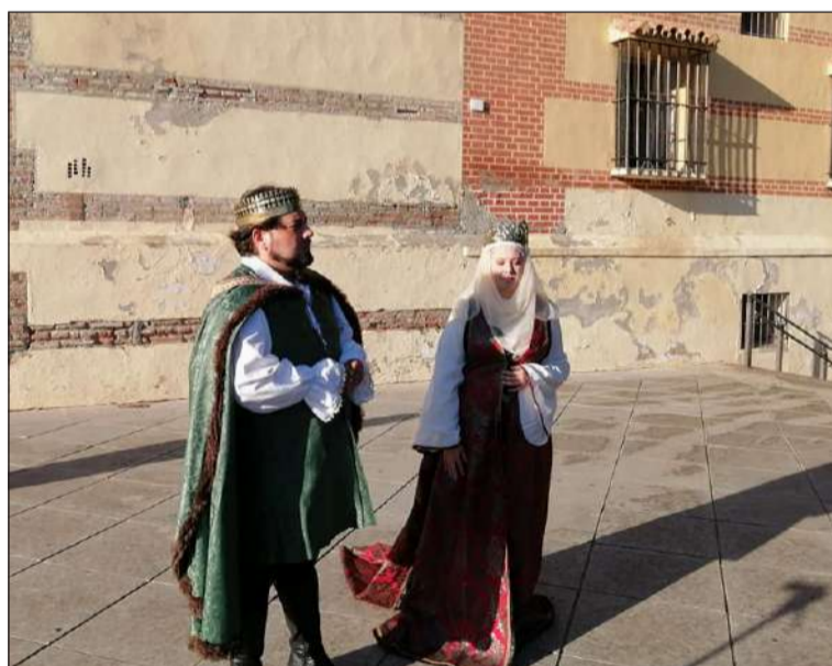
Personajes caracterizados de los Reyes Católicos ante el Santuario.

Unos días después se desarrollaba la I Ruta Victoriana con un gran éxito de afluencia y la participación de guías de Eventos Con Historia.