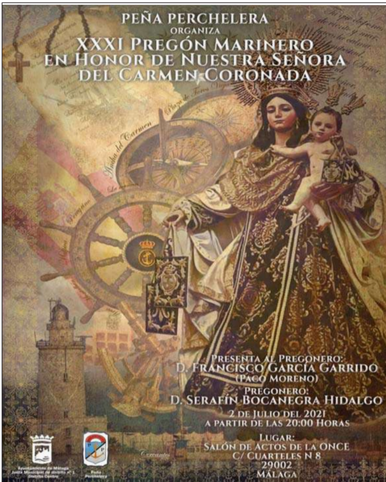
Cartel del Pregón a la Virgen del Carmen.