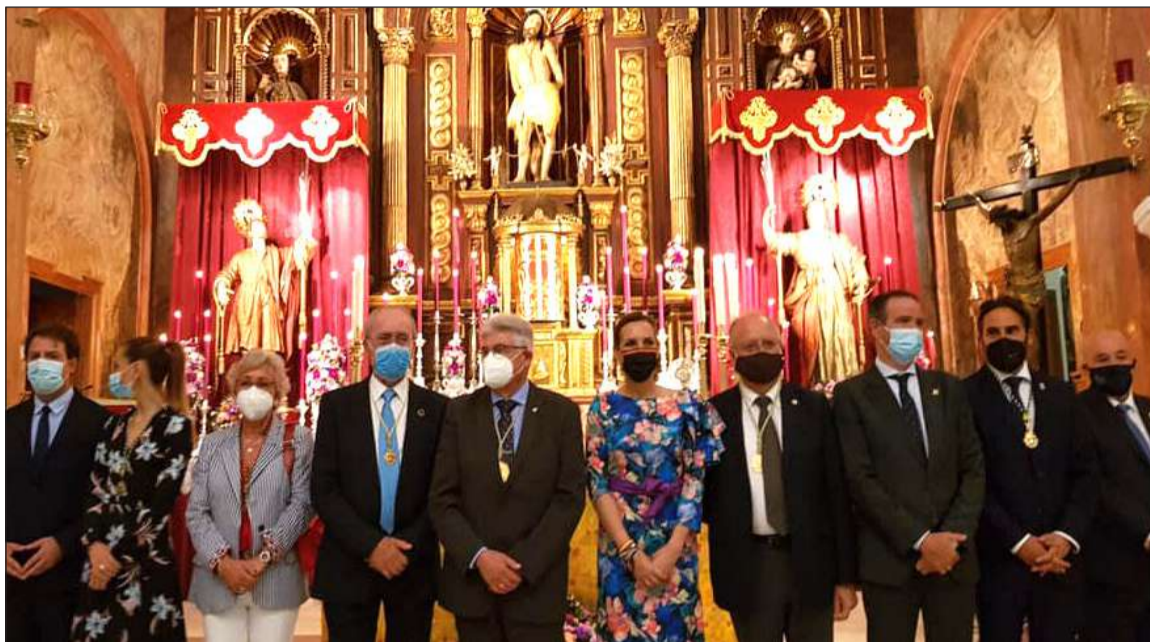
Autoridades e invitados al Pontifical en Honor a Santa Paula y San Ciriaco.