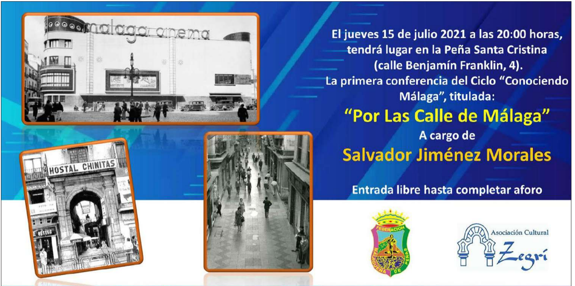
Premiera de las conferencias del ciclo, a desarrollar en la Peña Santa Cristina.