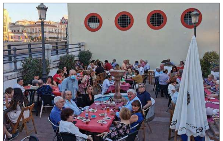
Vista de la Plaza Paco Márquez en la Verbena de la Peña Trinitaria.