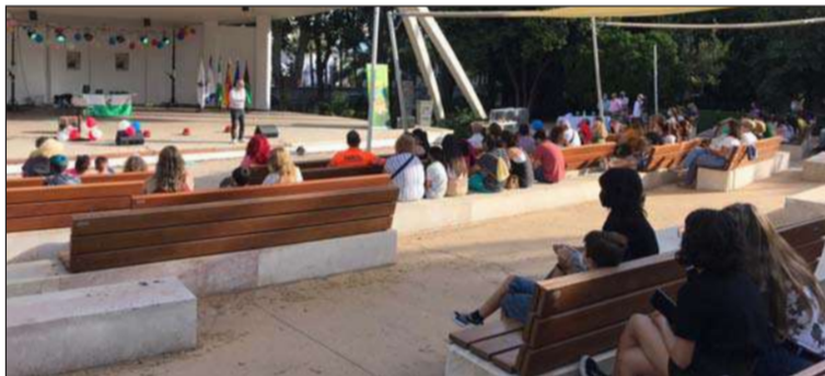
Un momento del acto.