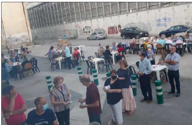
Socios esperan para degustar sardinas en el Centro Cultural Renfe.