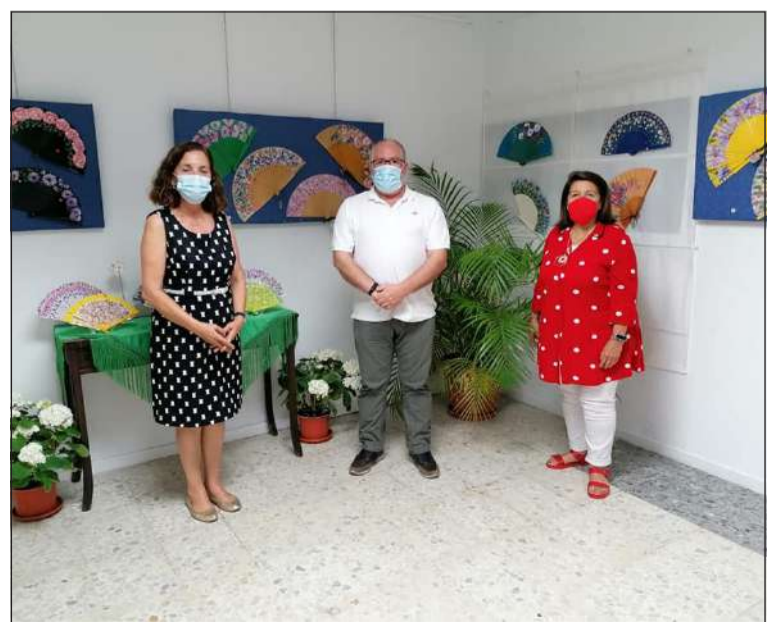
Presentación de la exposición 'Aires de Málaga'.

Detalles de la excursión para disfrutar de nuestra Málaga.