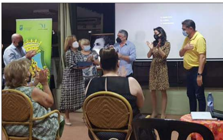
Agradecimiento al conferenciante.