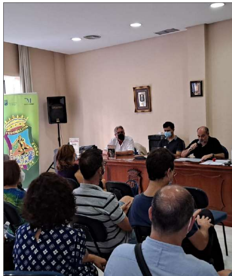
Presentación de Edad Media Soñada, de Ediciones Algorfa.