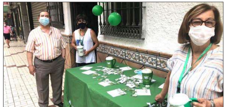
Peña Nueva Málaga.