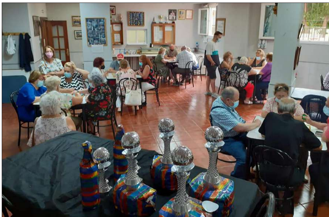
Imagen de la disputa del torneo.