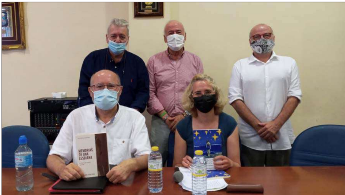
Presentación de Memorias de una lesbiana y Crónicas de un mar en calma, de Editorial Anáfora.