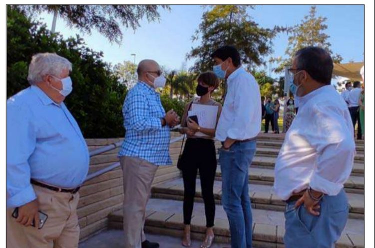
Encuentro mantenido con el vicepresidente de la Junta de Andalucía.