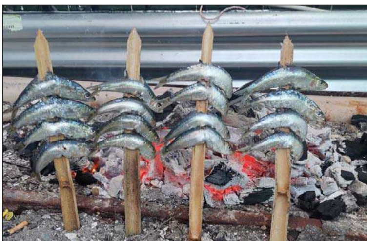
La Peña El Tomillar espetó las sardinas.