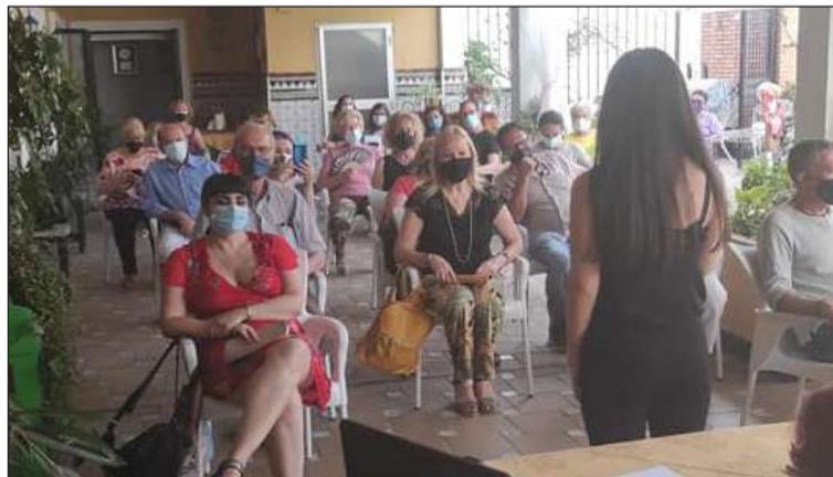
Recital poético en la terraza de la entidad.