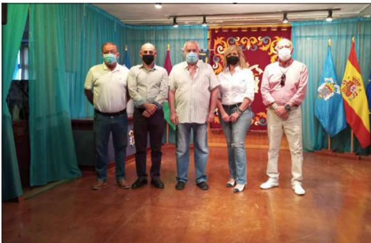
Asistentes a la celebración de San Juan en la Casa de Melilla.