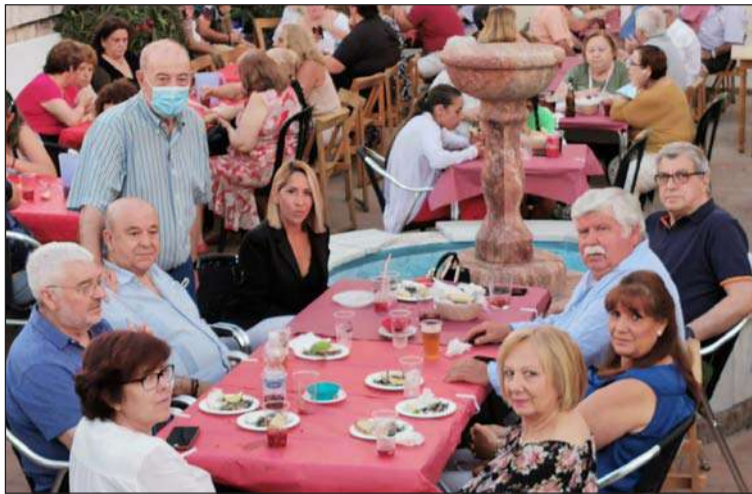
Verbena de la Peña Recreativa Trinitaria en la plaza Paco Márquez.