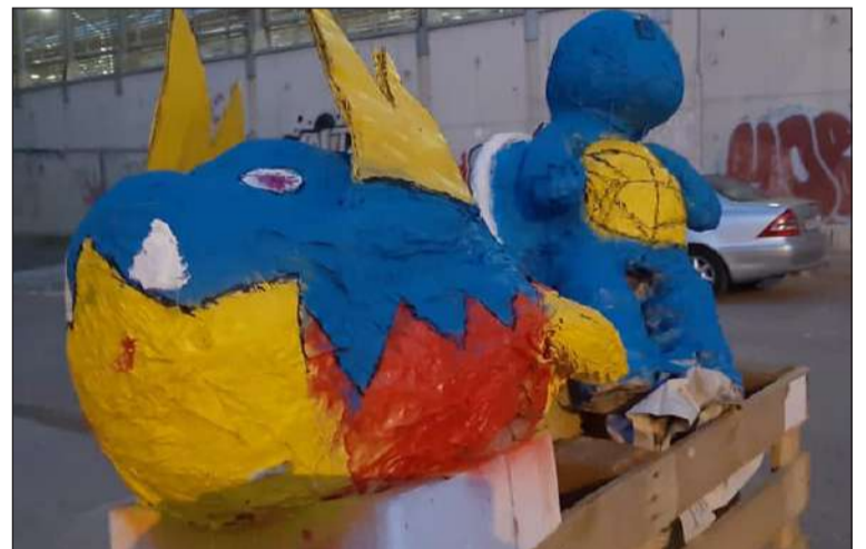
Júa que ardía en el Centro Cultural Renfe a las 12 de la noche.