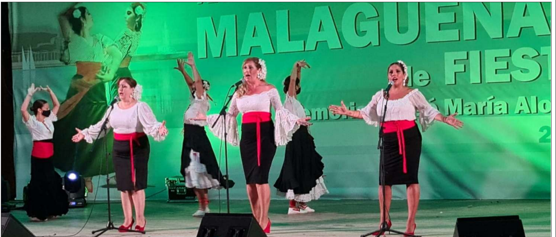
El Auditorio Eduardo Ocón es testigo del regreso del Certamen de Malagueñas de Fiesta en su XXXVI edición, que celebraba su semifinal el 18 de junio, y aguarda a la gran final del 17 de julio.

Número 728 30 de Junio de 2021 C/ Pedro Molina, 1 Tfno: 952 22 54 39 Fax: 952 21 48 82 E-mail: prensa@femape.com - fmpalcazaba@gmail.com Web: www.femape.com Edición digital: www.femape.com/laalcazabadigital Twitter: @FMPLaAlcazaba Facebook: www.facebook.com/FMPLaAlcazaba