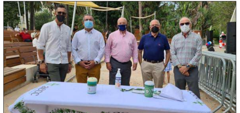
La Federación montó una mesa el jueves y viernes en el Eduardo Ocón.