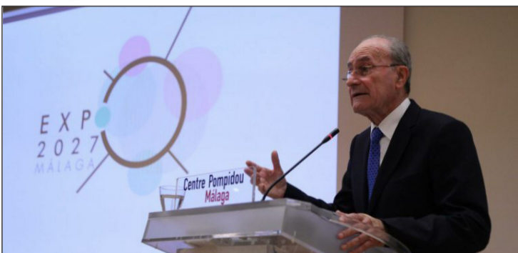
Presentación del proyecto por parte del alcalde.

La Federación Malagueña de Peñas, Centros Culturales y Casas Regionales 'La Alcazaba' remitió en la jornada del pasado 4 de enero al alcalde, Francisco de la Torre, un carta de adhesión al proyecto para que la Ciudad de Málaga acoja una Exposición Universal en el año 2027.