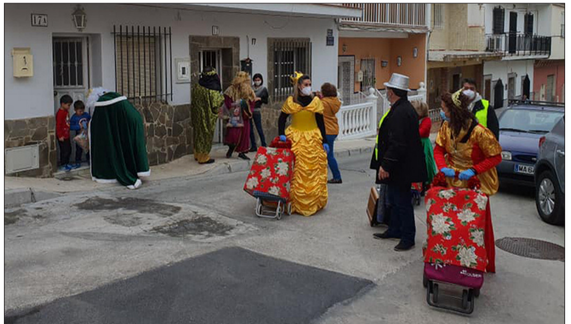
Voluntarios de la Asociación de Vecinos Hanuca acompañan a Sus Majestades.

Hay cosas que son exclusivamente malagueñas