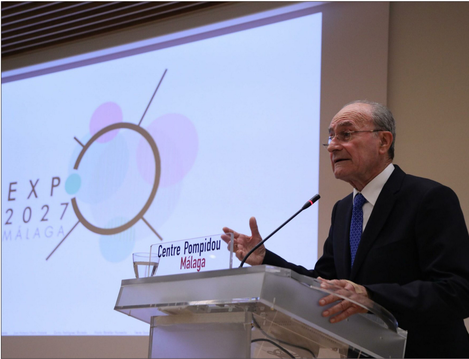
Una presentación del alcalde al proyecto para la celebración de este acontecimiento en nuestra capital.