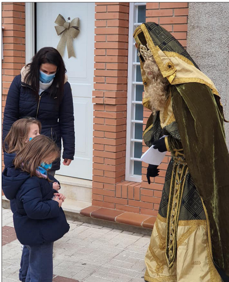
Unas niñas saludan al Rey Gaspar en presencia de su madre.