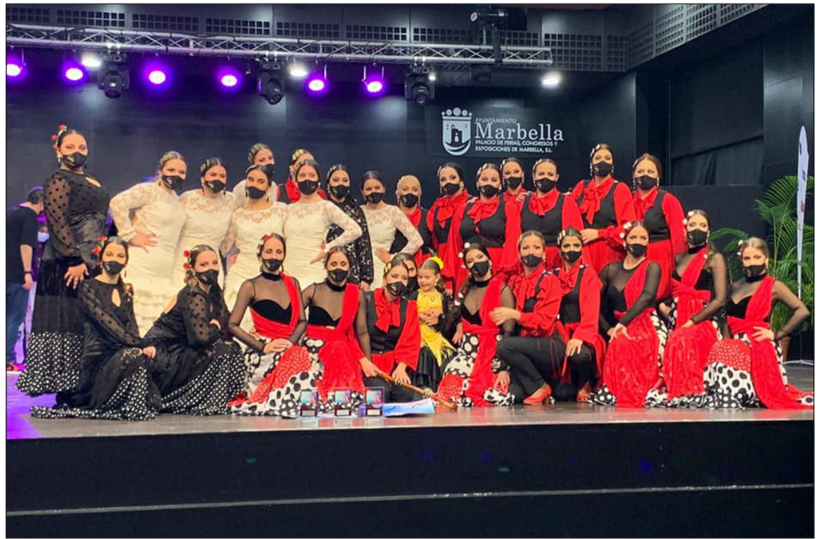
Componentes de Mar de Rosas en D'Life Marbella.