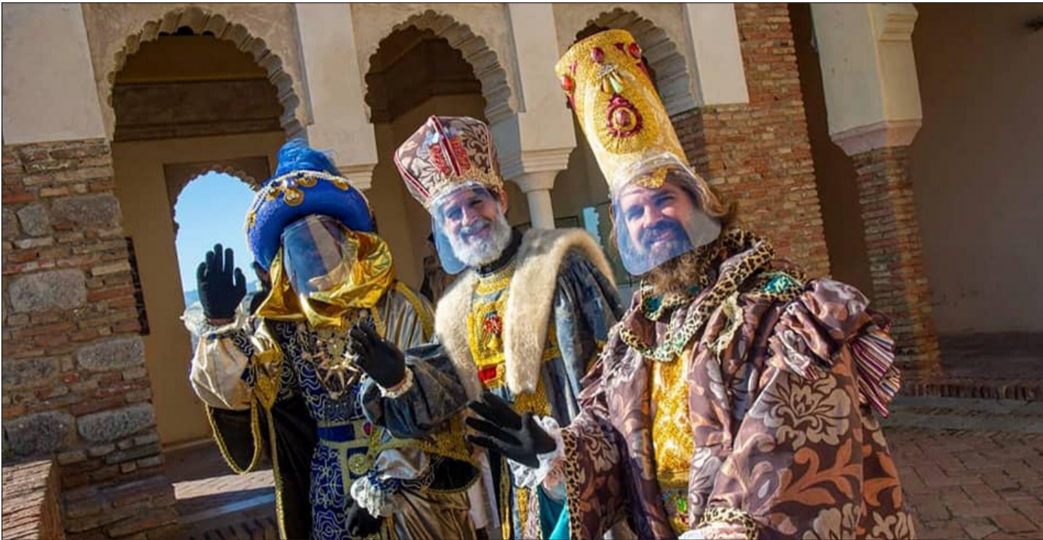
Llegada de los Reyes Magos, con pantallas de protección, a la Alcazaba de Málaga en la tarde del pasado 5 de enero.

Número 716 13 de Enero de 2021 C/ Pedro Molina, 1 Tfno: 952 22 54 39 Fax: 952 21 48 82 E-mail: prensa@femape.com - fmpalcazaba@gmail.com Web: www.femape.com Edición digital: www.femape.com/laalcazabadigital Twitter: @FMPLaAlcazaba Facebook: www.facebook.com/FMPLaAlcazaba