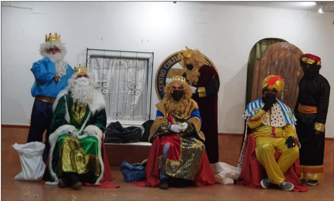
Un instante de la visita de los Reyes Magos a la sede de la entidad.