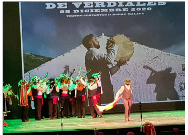
Imagen del acto celebrado en el Teatro Cervantes.