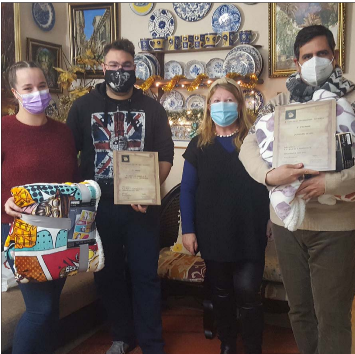
Los ganadores, con la presidenta de la entidad.