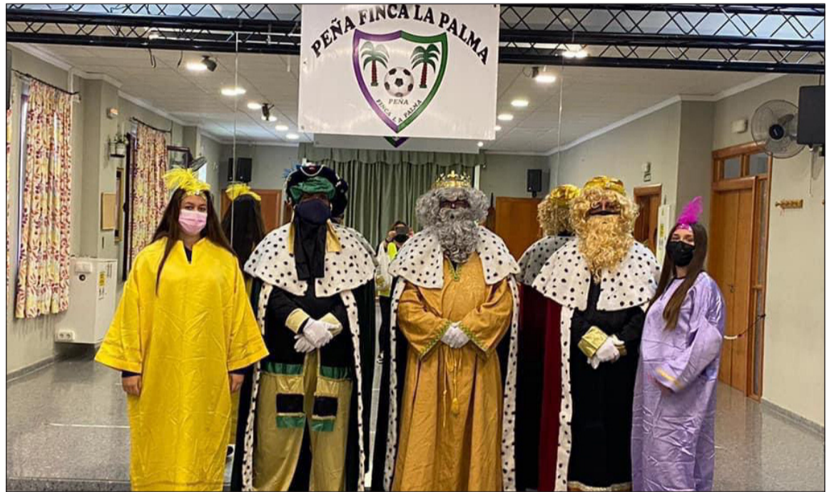
Los Reyes Magos, en el interior de la Peña Finca La Palma.