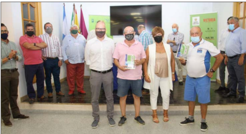
Los hijos de Rafael Fuentes asistieron a la entrega de premios.