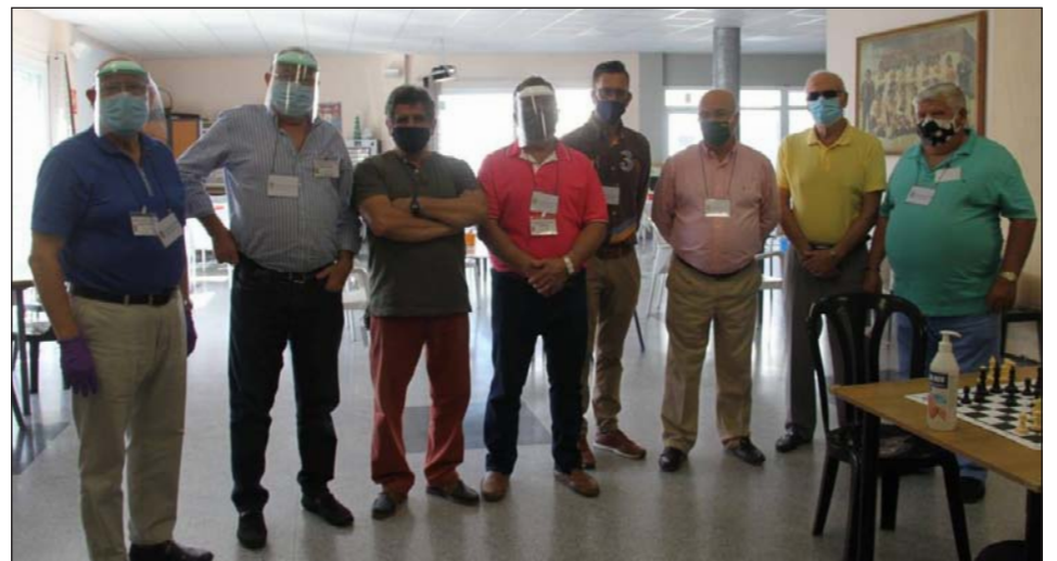
Directivos y colaboradores de la Federación, encargados de la organización de las olimpiadas.

Hay cosas que son exclusivamente malagueñas