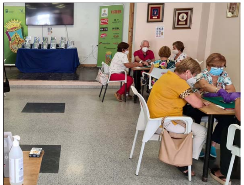
Se han extremado las medidas sanitarias, como en este caso en el Chinchón.