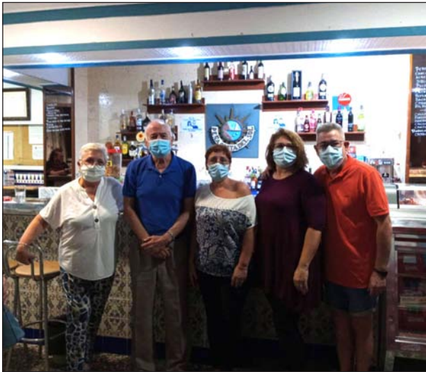
Peña Costa del Sol.