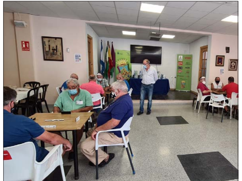
Vista general de la sala durante las partidas de Dominó.