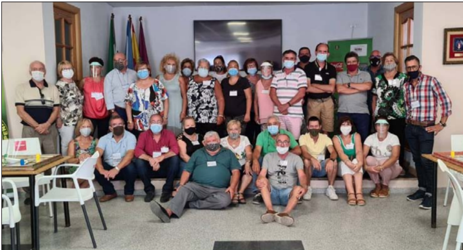
Participantes en la competición de ajedrez, en una foto de grupo con miembros de la organización.