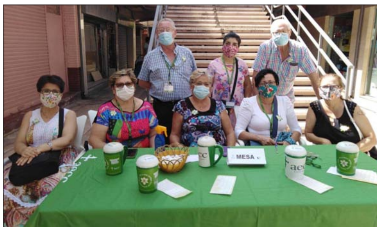
Socios de la Peña Ciudad Puerta Blanca en la mesa petitoria.

De este modo, se instalaba una mesa petitoria en el exterior de su sede, en la Avenida Gregorio Diego, que fue atendida por los integrantes de esta entidad perteneciente a la Federación Malagueña de Peñas, Centros Culturales y Casas Regionales 'La Alcazaba'.