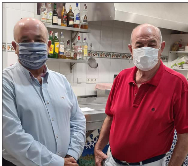
Peña Recreativa Trinitaria.