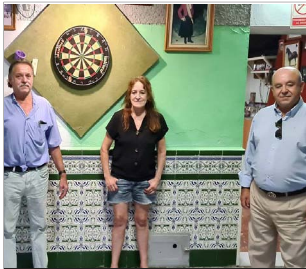
Peña Los Pastores de Colmenarejo.