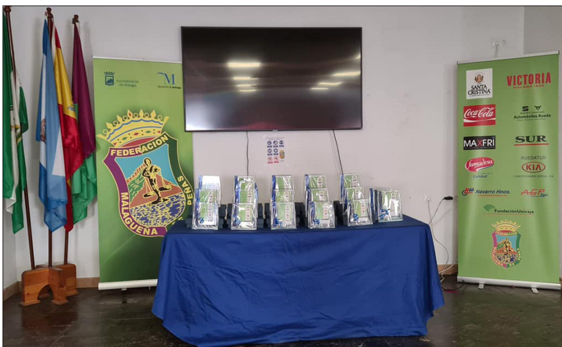
Los dos roll ups instalados en la entrega de trofeos de las XV Olimpiadas de Juegos de Peñas.