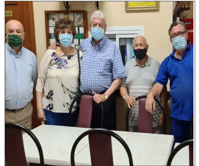
Peña Recreativa Martiricos.