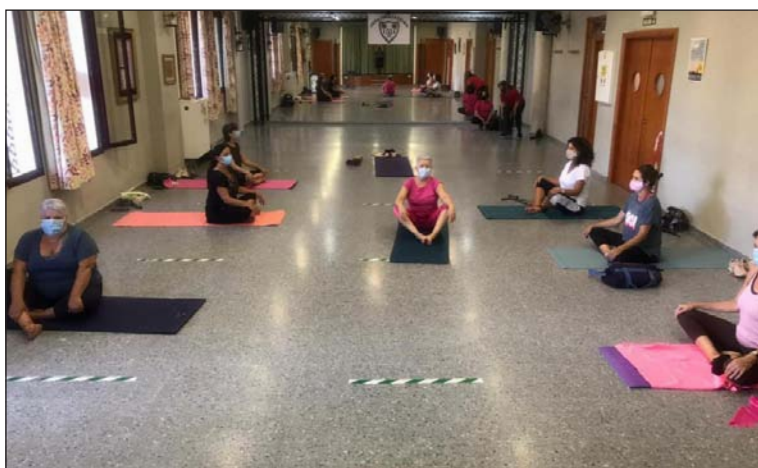
Clase matinal de yoga.

Además, se incorporan nuevas disciplinas como el baile flamenco, que va a comenzar a impartirse en la sede de esta entidad perteneciente a la Federación Malagueña de Peñas, Centros Culturales y Casa Regionales 'La Alcazaba'.