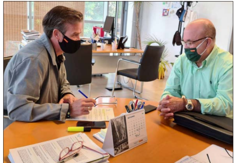
Un instante de la reunión celebrada en la sede de la Diputación.