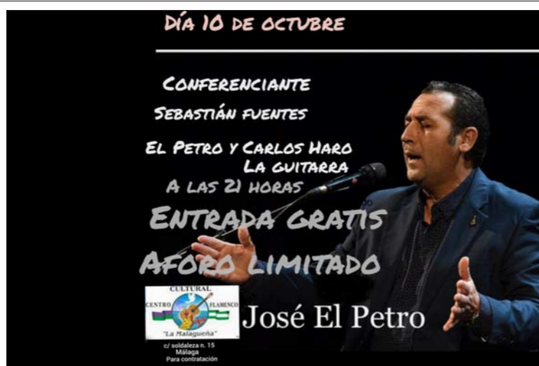
Conferencia sobre Fandangos de Huelva prevista para el sábado 10 de octubre.