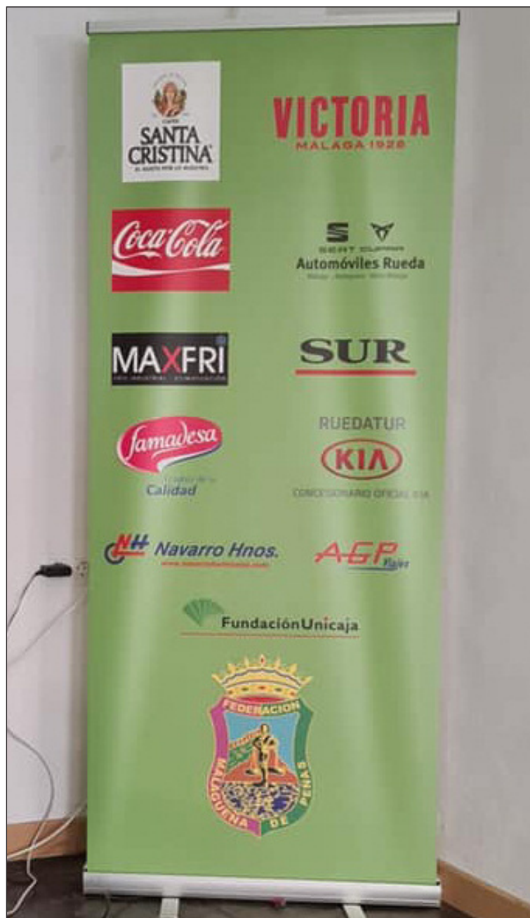
Los logos de los patrocinadores están incluidos en el material promocional.

Entidades colaboradoras con esta publicación: