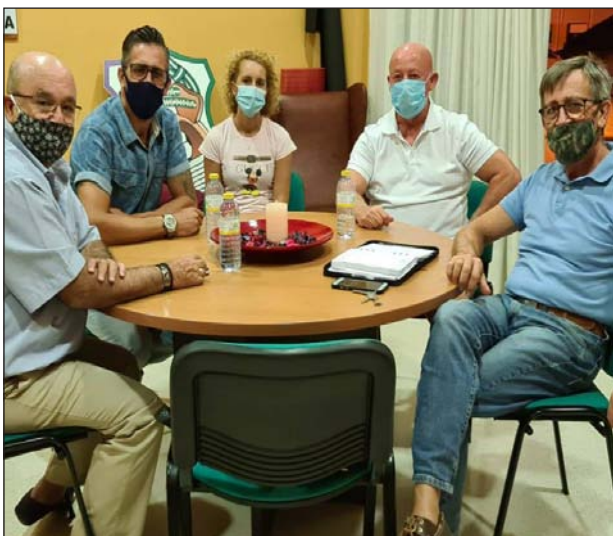
Peña Santa Cristina.