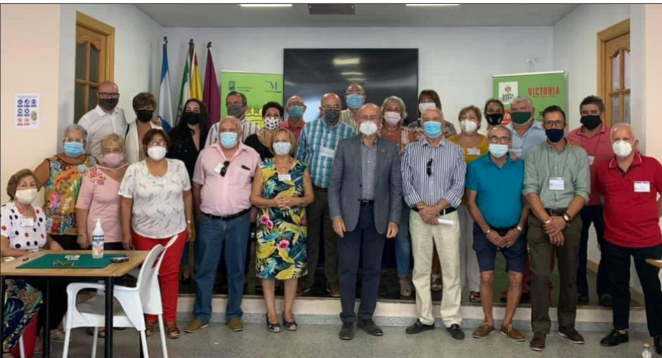
Las autoridades, con participantes en la categoría de Chinchón.