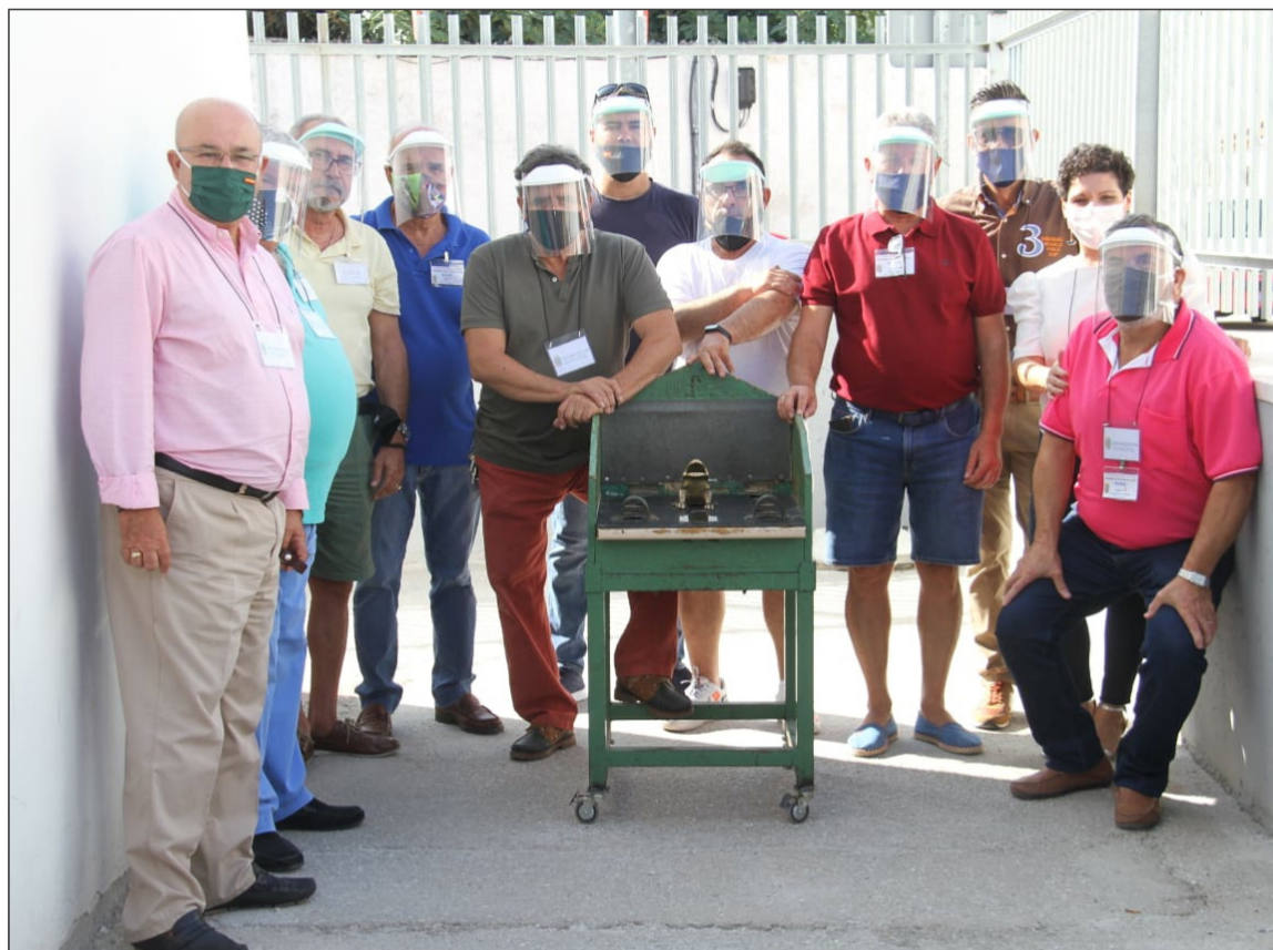
Participantes en la categoría de Rana, con miembros de la organización.