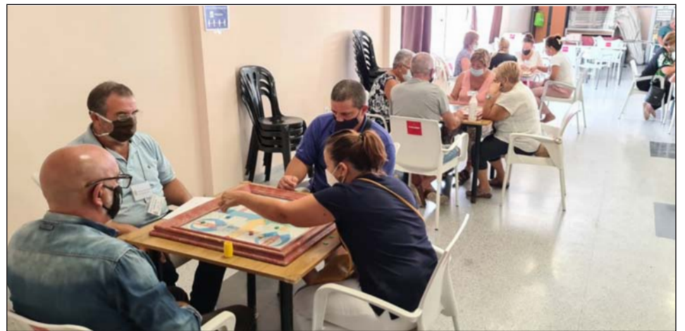
Un instante de la competición de parchís.