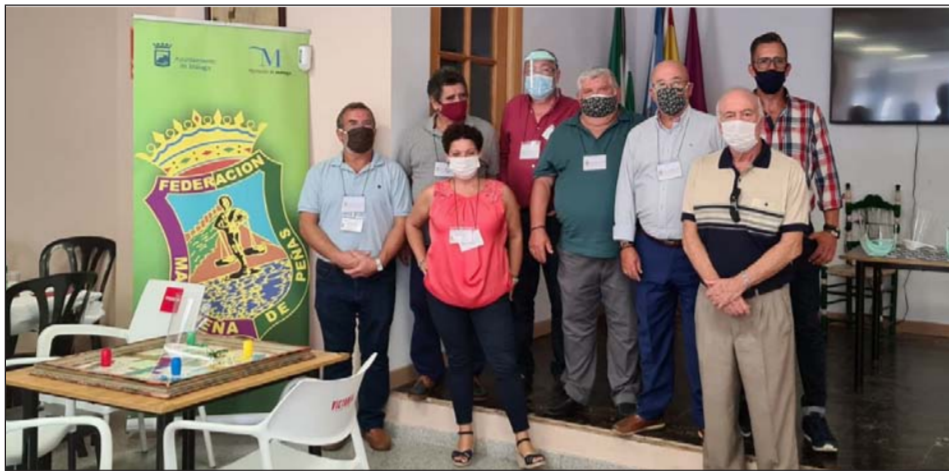
Directivos y colaboradores de la Federación Malagueña de Peñas en la organización.