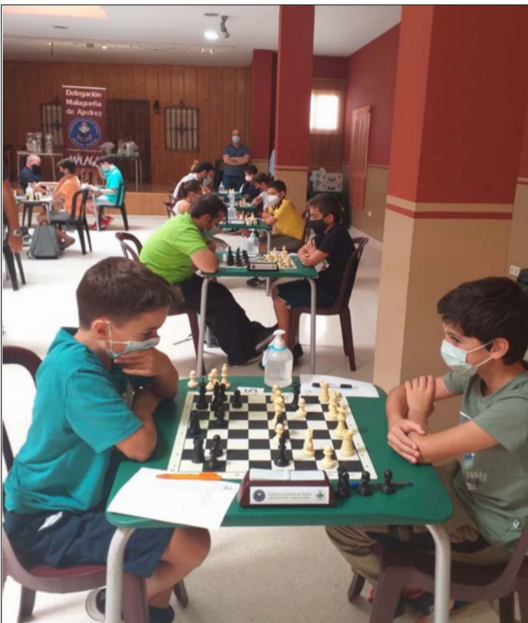
Un instante de la competición.

Con tal motivo, se adaptaron las instalaciones para acoger con todas las medidas de seguridad a todos los participantes en una jornada que se disputó con total normalidad y que concluía con un acto de entrega de trofeos a los ganadores.