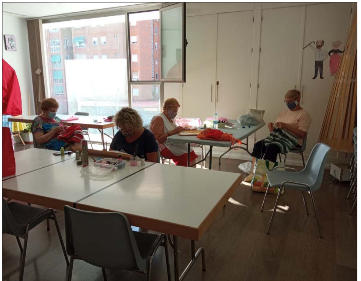
Un momento del taller.

Mantones, flecos o abanicos son algunos de los trabajos que están realizando en estos momentos los alumnos, retomando la actividad que se veía interrumpida en el pasado mes de marzo.