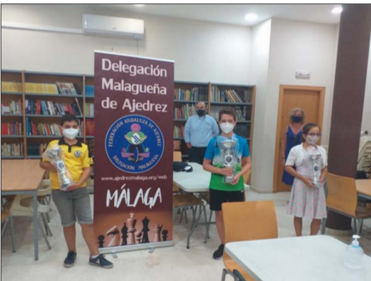
Entrega de trofeos para los ganadores.