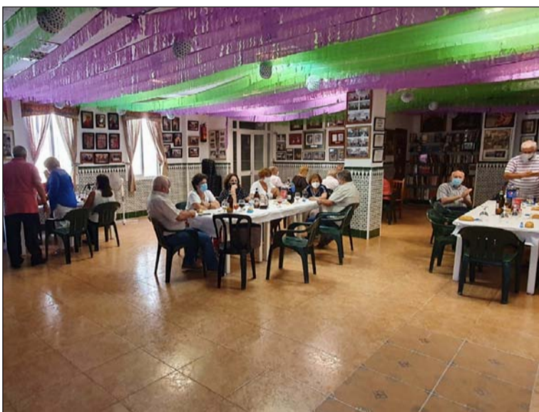
Vista general del salón durante la actividad.

son sus comidas de hermandad. Este fue el caso el pasado sábado de la Peña Perchelera, que acogió a sus socios, adoptando las limitaciones de número de comensales por mesa, y fijando las distancias entre ellas,