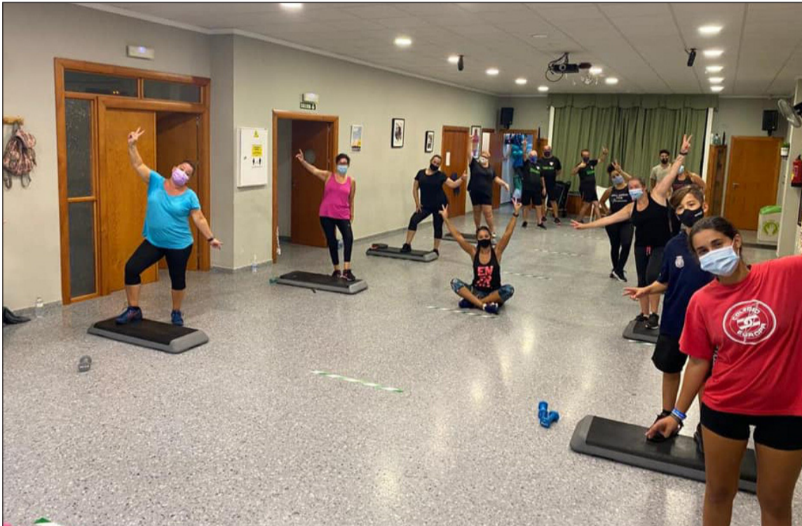
Primera clase de step, en la que se aprecia las distancias de seguridad que se han marcado entre los participantes.

yoga, y salsa, para lo que se han que este año son limitadas con el objetivo de poder garantizar la aplicación de todas las normas de seguridad para la prevención del Covid-19.