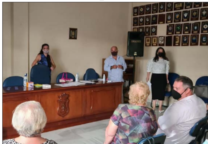
Presentación del segundo ciclo y reencuentro de los alumnos.

La Federación Malagueña de Peñas, Centros Culturales y Casas Regionales 'La Alcazaba' volvía a acoger el pasado lunes 14 de septiembre a los alumnos de la Escuela de Cante y Copla 'Miguel de los Reyes', después de haber celebrado el primer ciclo de este curso 2020 a través de las herramientas telemáticas que se habilitaron. La sede peñista se ha adaptado para hacer de estas clases un espacio seguro frente al Covid-19.