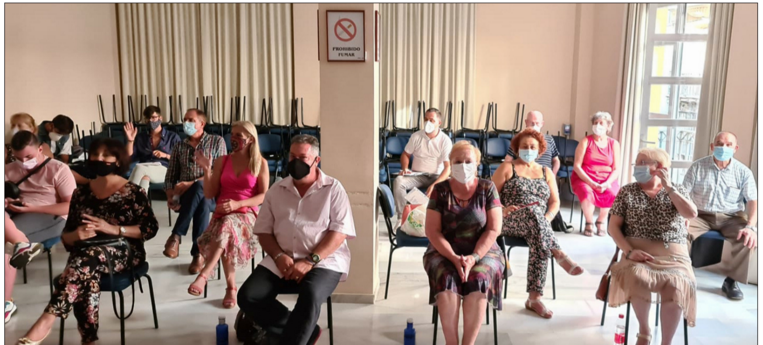
Alumnos asistentes a la primera reunión informativa celebrada el lunes 14 de septiembre.

Hay cosas que son exclusivamente malagueñas