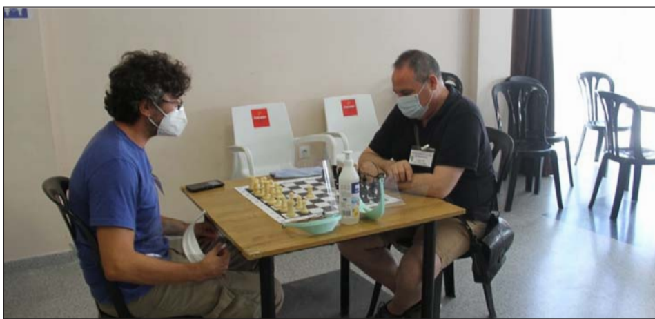
Disputa de una partida de ajedrez.