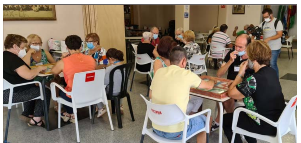
Vista general del salón durante el juego del parchís.