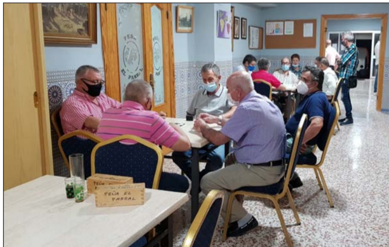
Socios disfrutan de las nuevas instalaciones de la entidad.

Según se recuerda en un comunicado "todos los socios y socias para acceder a nuestras instalaciones tendremos que llevar la mascarilla reglamentaria puesta durante todo el tiempo que permanezcamos dentro de la peña". Además, se han habilitado alfombras desinfectantes, se cuenta con gel hidroalcohólico y se dispone de termómetro para tomar la temperatura a la hora de acceder al recinto.