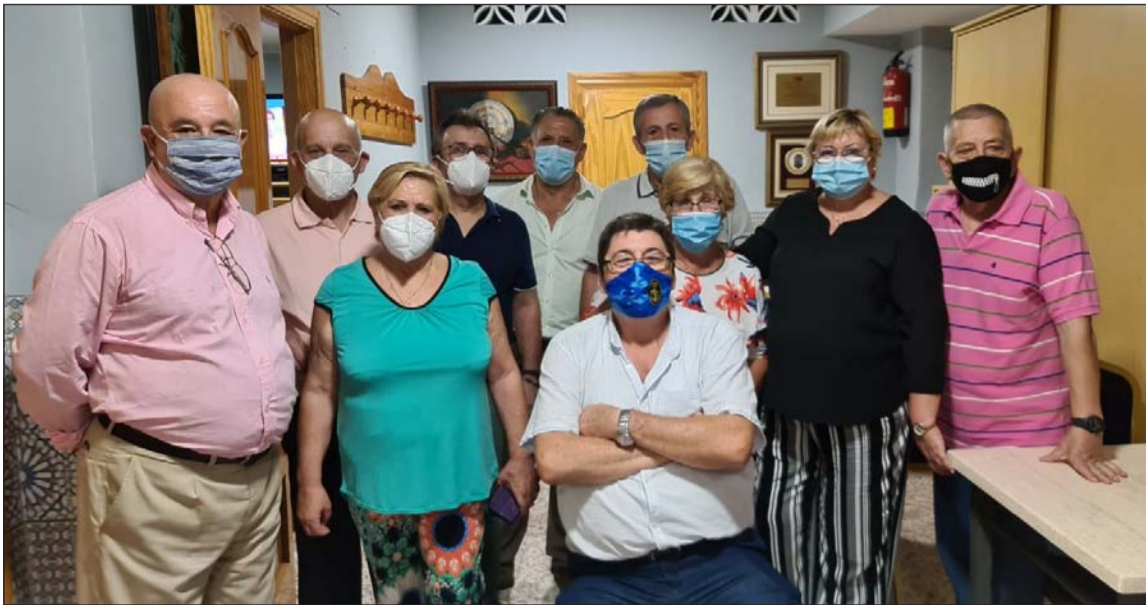
El presidente de la Federación, con la presidenta de El Parral y su junta directiva.