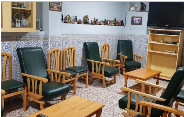
Equipamiento para las nuevas dependencias de la Peña El Parral.