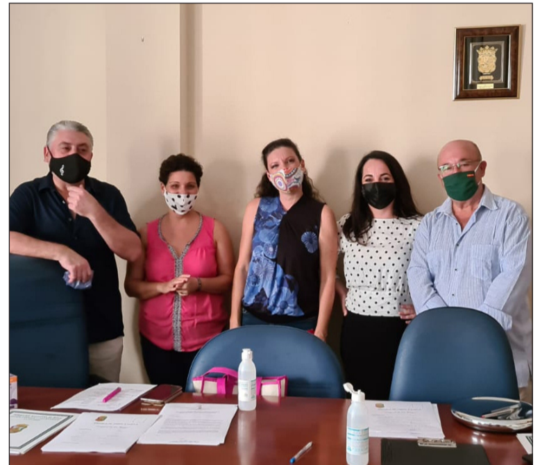
Profesores y representantes de la Federación, en el regreso de las clases.