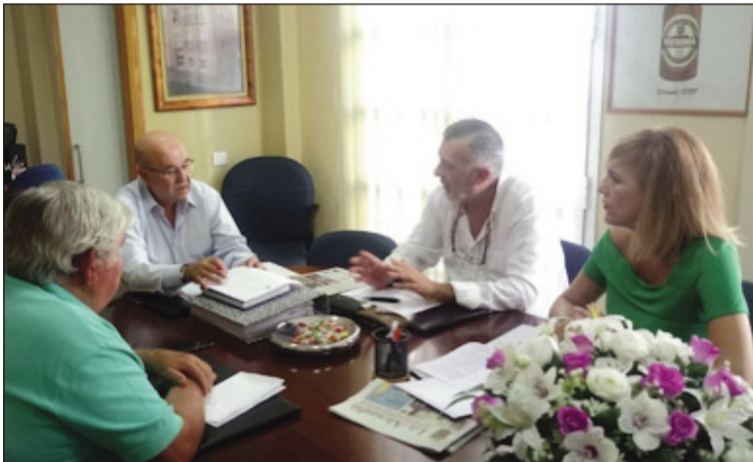
Reunión mantenida con representantes de Vox.