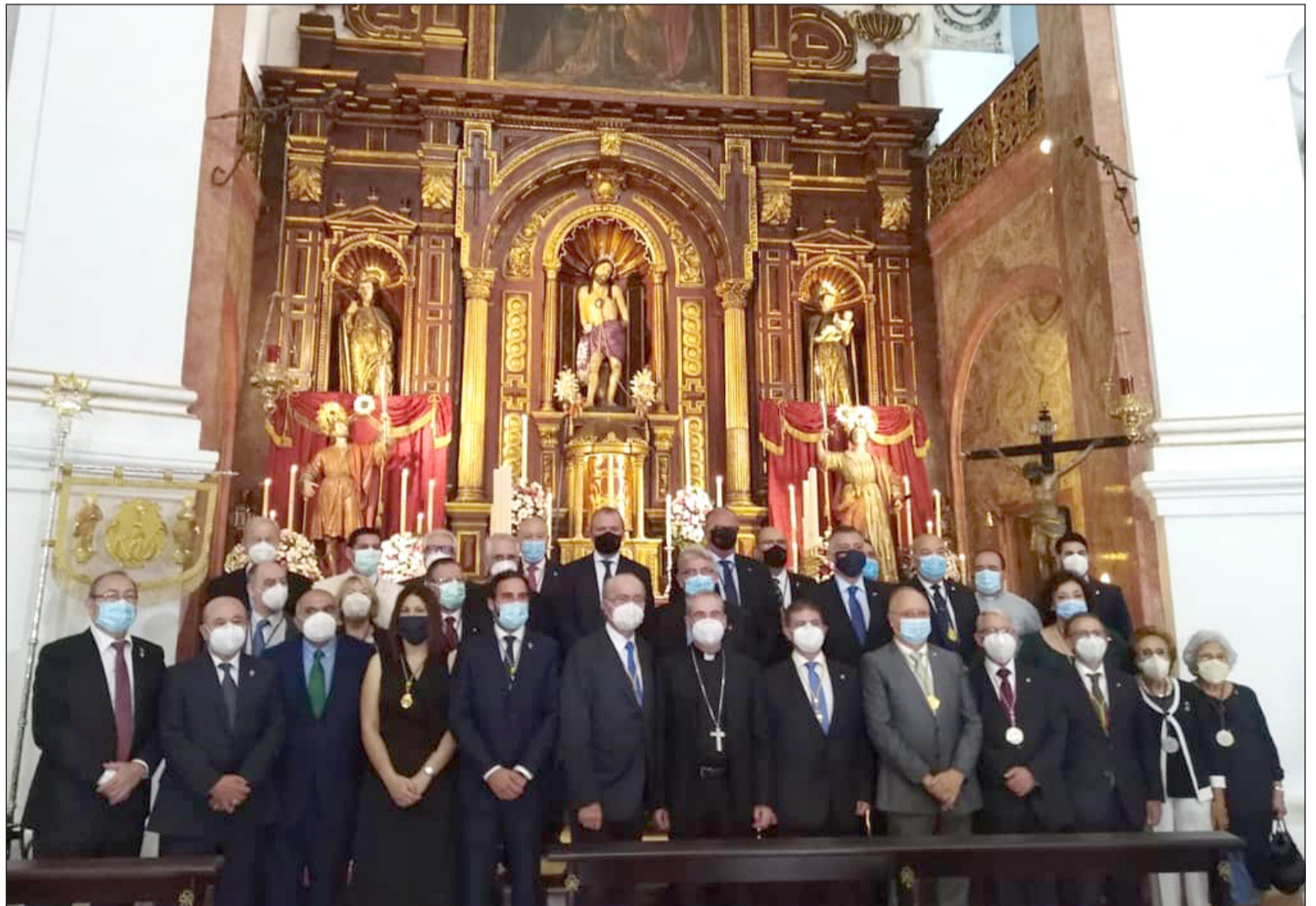
Asistentes a la Misa Estacional presidida por el Obispo, con la presencia de una representación de la Federación Malagueña de Peñas.

Hay cosas que son exclusivamente malagueñas