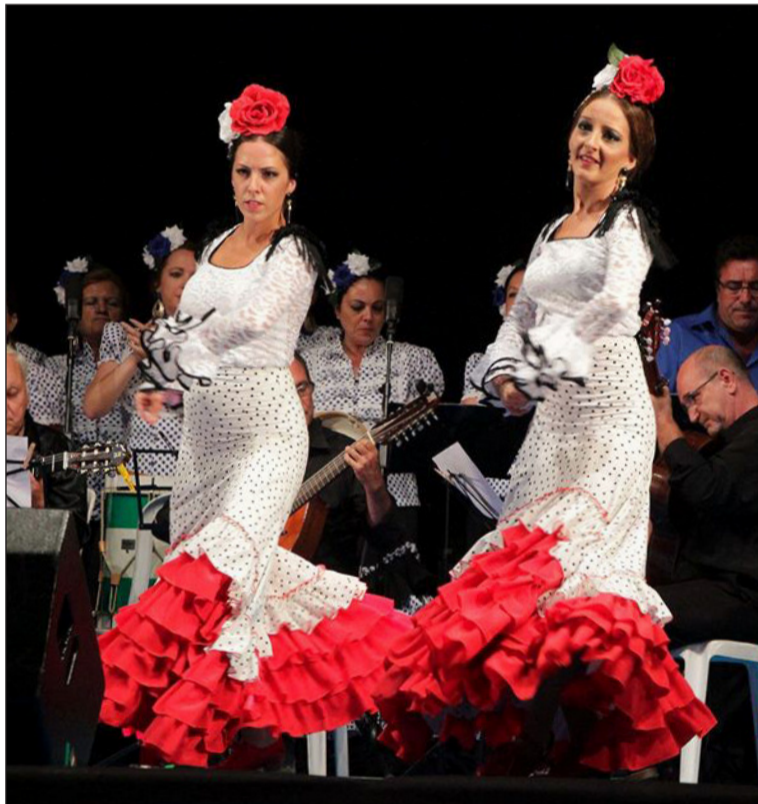
Imagen de archivo de Solera en un festival.

Desde Solera se espera poder recuperar con normalidad este evento en el próximo año, lo que sería el broche de oro a unas celebraciones del XXX Aniversario de la Asociación que también se están visto afectadas por la pandemia.