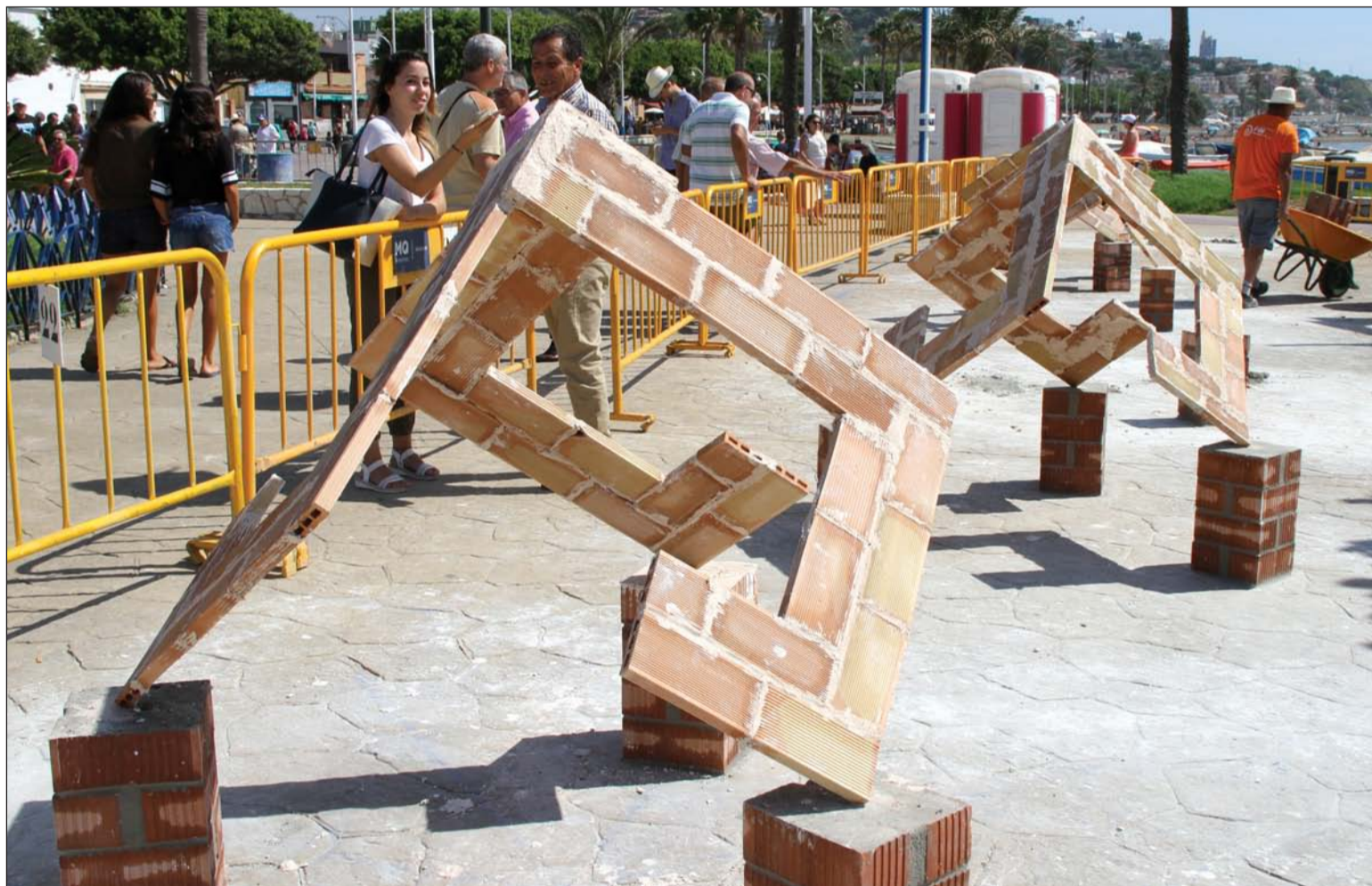
Figura que tuvieron que realizar las cuadrillas participantes en el certamen del pasado año.

Cada año es tradicional que se presente esta obra en la plaza del Padre Ciganda, coincidiendo con las Fiestas Deportivas y Marineras que en Honor a la Virgen del Carmen se celebran en El Palo, y que este año también han sido suspendidas.