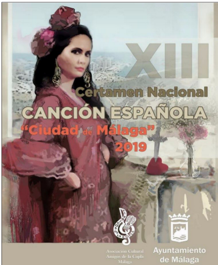
Cartel del certamen de 2019.

La suspensión de la Feria de Málaga 2021 ha supuesto, por tanto, que se cancele la edición correspondiente a este año.