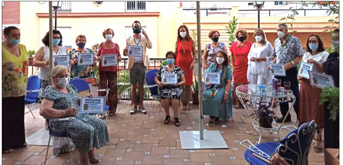
Entrega de premios del Concurso de Cruces de Mayo.