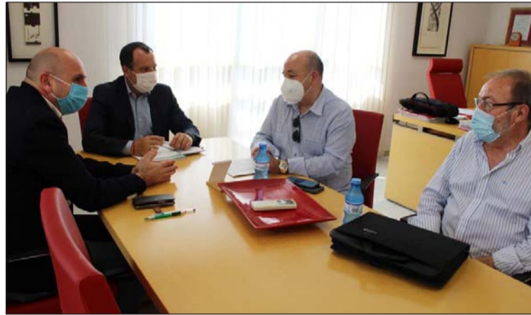
Reunión mantenida con los parlamentarios socialistas.