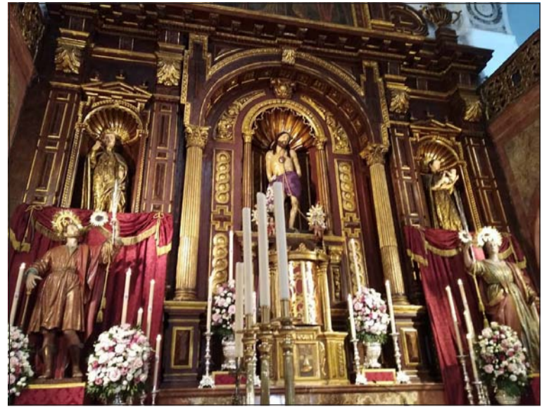
Altar de la Iglesia del Santo Cristo con los Santos Patronos.