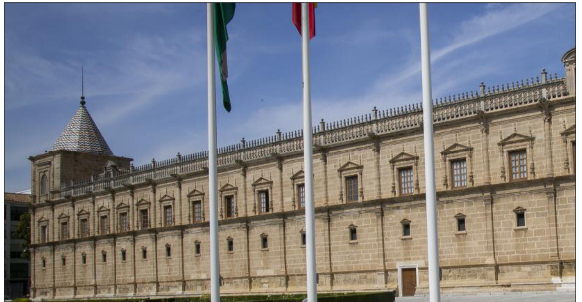
Sede del Parlamento Andaluz en el Palacio de San Telmo de Sevilla.