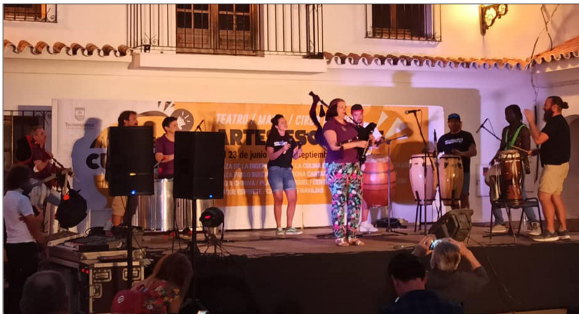
Un instante de la actuación conjunta de la Escuela de Gaitas y Percutora.

Además, se abre la esperanza para realizar nuevas actividades, como su participación en la Noche Celta de Mijas, en la que ya actuara el pasado año, y que ya ha anunciado su celebración para la jornada del próximo 8 de agosto. La Banda de Gaitas del Centro Asturiano ha sido la imagen de este anuncio de la organización.