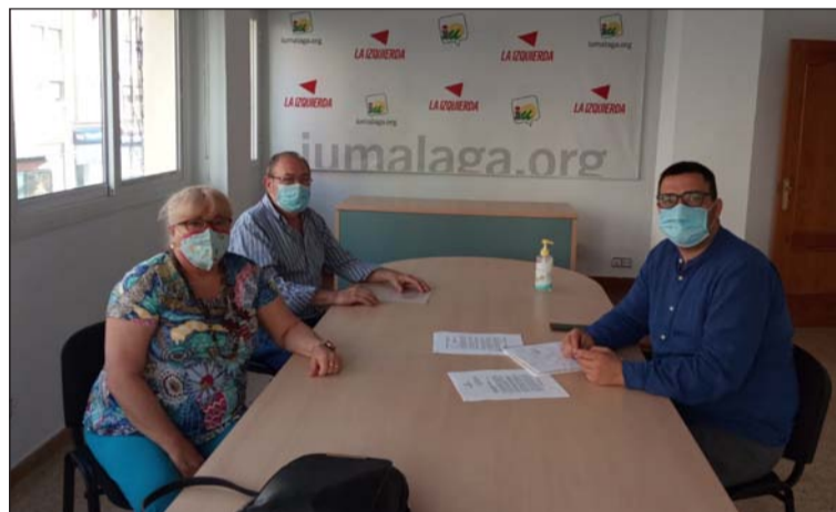
Encuentro con el parlamentario de Adelante Andalucía Guzmán Ahumadas.