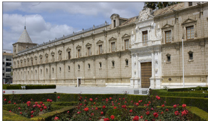
Imagen del Palacio de San Telmo de Sevilla, sede del Parlamento Andaluz.

La Federación Malagueña de Peñas está manteniendo una ronda de contactos con todos los grupos parlamentarios andaluces en Málaga para explicarles las alegaciones presentadas a los Reglamentos de Ruegos para regular la Lotería Familiar. Además, se está preparando un desplazamiento para que todo el colectivo pueda mostrar su apoyo a estas medidas en el propio Parlamento de Andalucía el próximo 23 de julio.