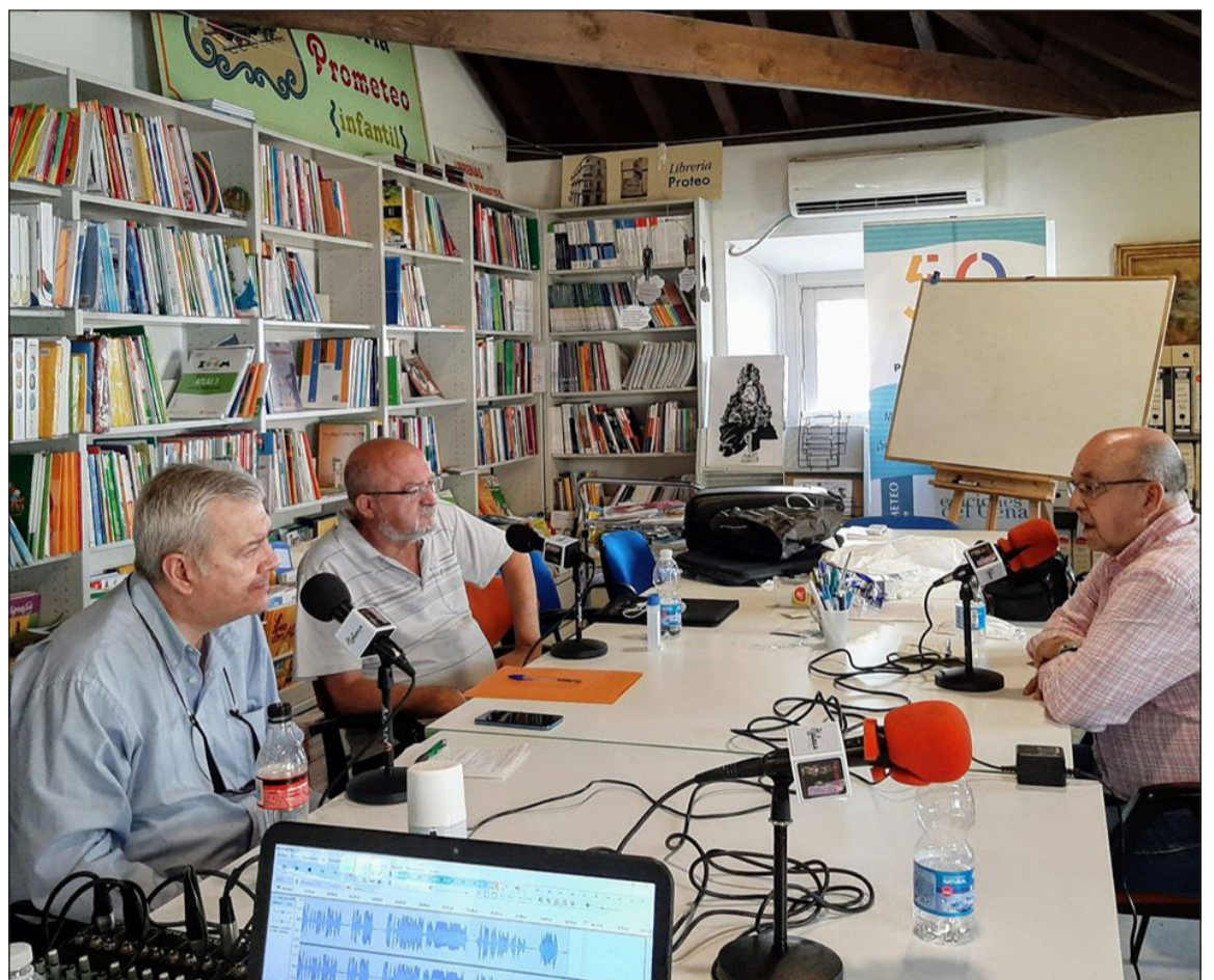
Imagen del programa en el que intervenía el presidente de la Federación Malagueña de Peñas.