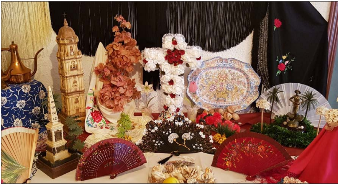
Cruz de Mayo ganadora entre los socios de la Peña Perchelera.