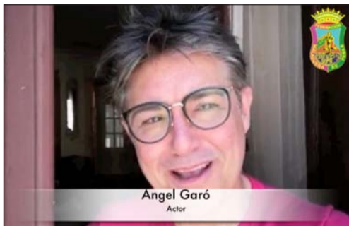
Angel Garó Actor