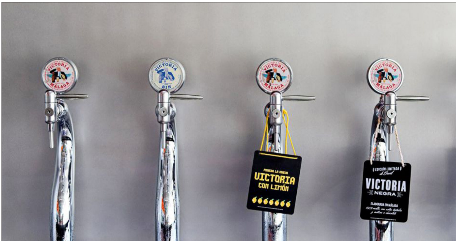
Sólo en Málaga se servirán unas 600.000 cañas gracias a esta colaboración de Cervezas Victoria con los hosteleros.

Por otra parte, durante esta pandemia, Cervezas Victoria ha reforzado la colaboración frente al Covid 19 aumentando la donación de agua y la cesión de materiales a distintas asociaciones. Se han repartido más de 65.000 botellas de agua y aseguran que continuarán mientras se prolongue la situación actual.