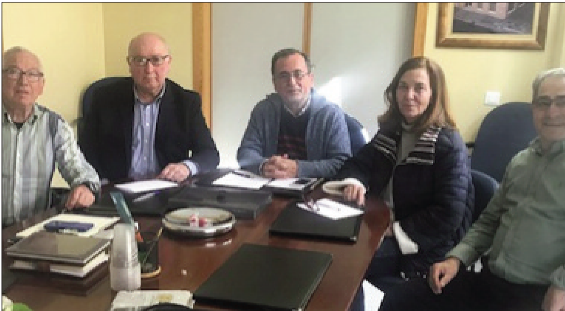
Miembros de la Comisión Revisora de Cuentas, durante su constitución en 2019.