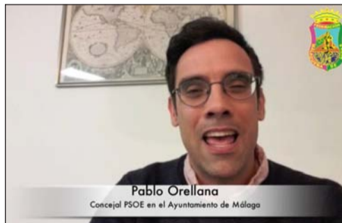
Pablo Orellana Concejal PSOE en el Ayuntamiento de Málaga