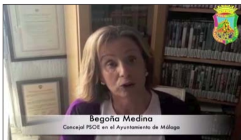
Begoña Medina Concejal PSOE en el Ayuntamiento de Málaga