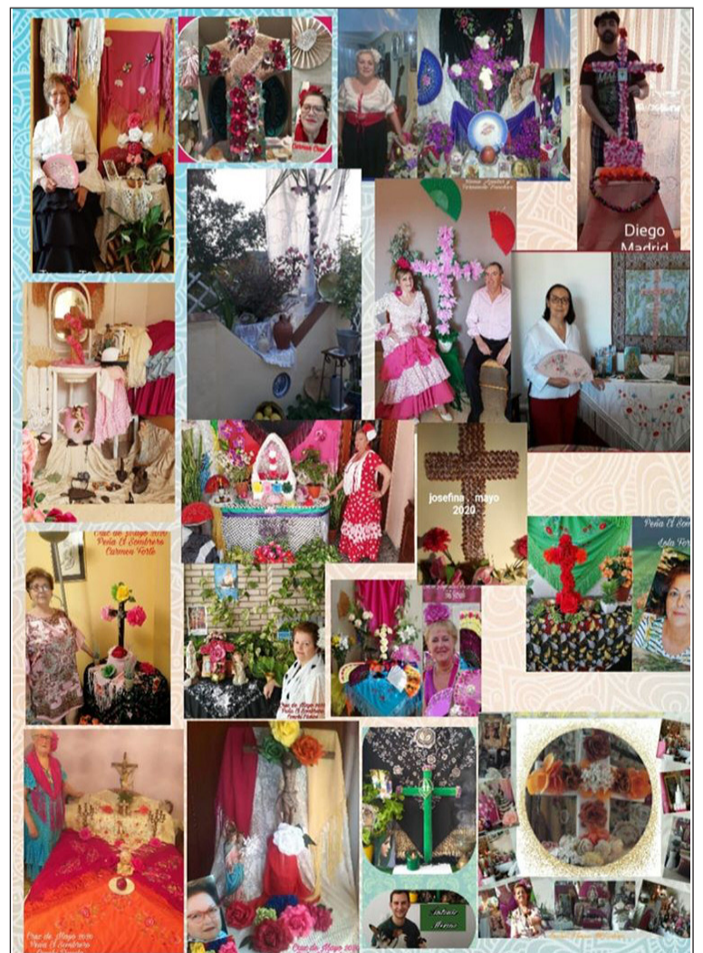
Cruces de Mayo participantes en el concurso de la Peña El Sombrero.