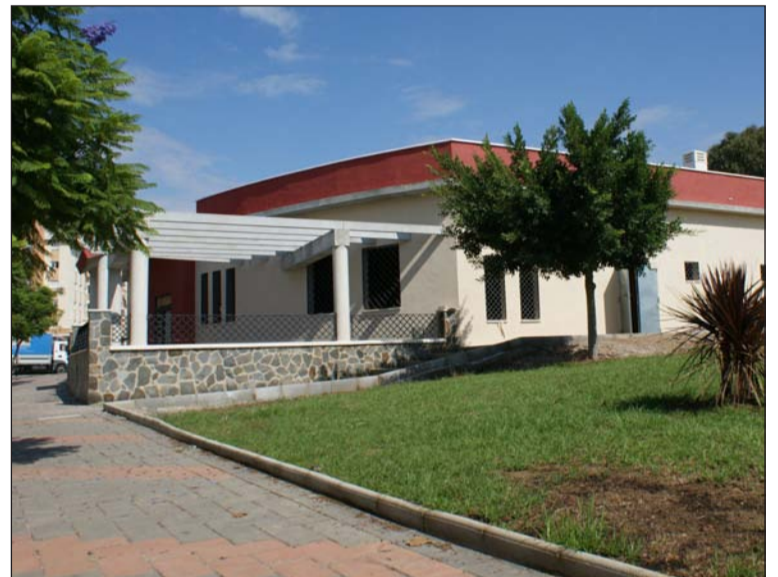
La normativa refleja la ocupación de las terrazas, como esta de Finca La Palma.