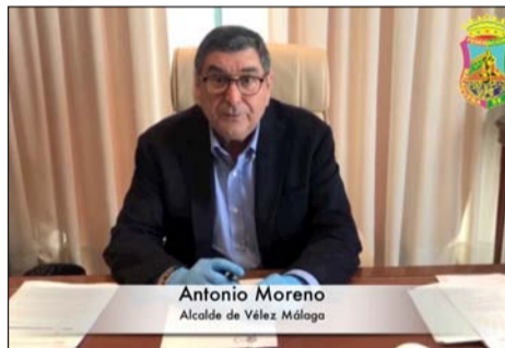
Antonio Moreno Alcalde de Vélez Málaga