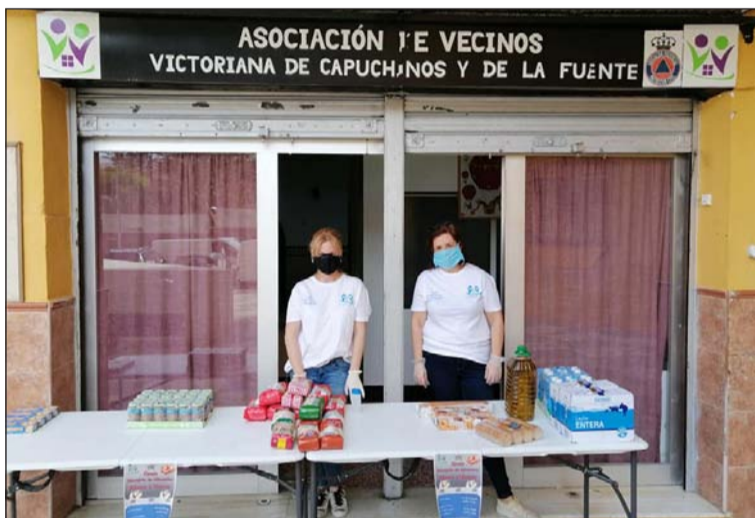
Miembros de la asociación en la puerta de su antigua sede.