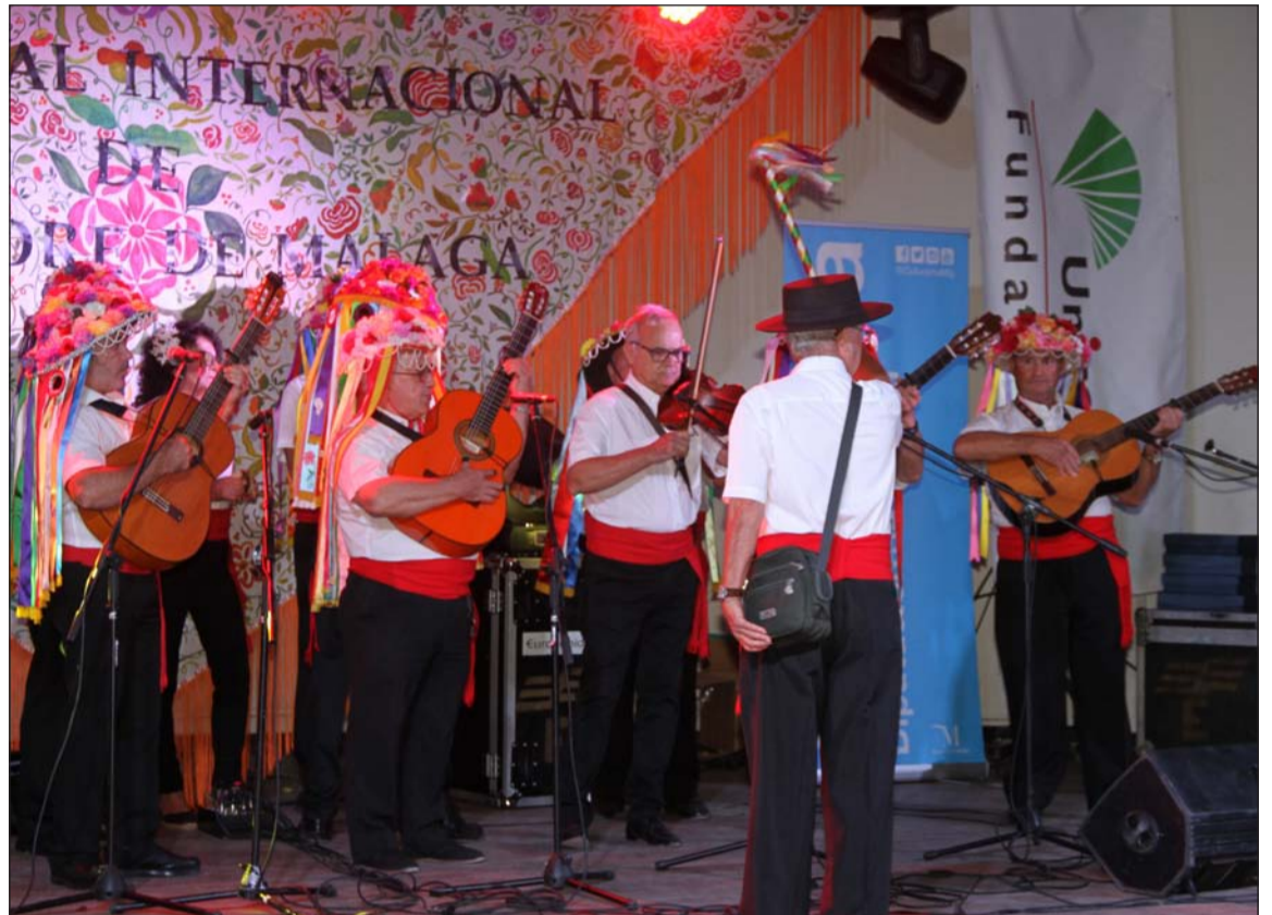
Imagen de archivo de la edición anterior del Festival, con los verdiales representando a nuestro folclore.

Este festival no se celebraba en nuestra capital desde el año 2011, y su recuperación tuvo un resultado espléndido al contar con un gran respaldo de los malagueños.