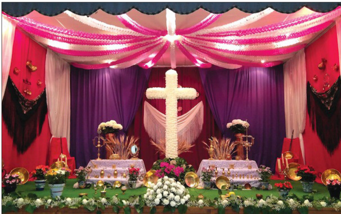
Cruz de Mayo de la Casa de Álora Gibralfaro, primer premio en el concurso de 2019.