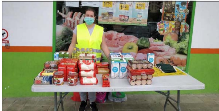
Una voluntaria en el exterior de uno de los establecimientos colaboradores.

La Peña Finca La Palma se ha unido a otros colectivos del Distrito de Teatinos para realizar una labor de voluntariado a través de la cual se han repartido a las puertas de diferentes establecimientos mascarillas a cambio de un kilo de alimentos que van a ser distribuidos a través de la Asociación de Mujeres de La Laguna.