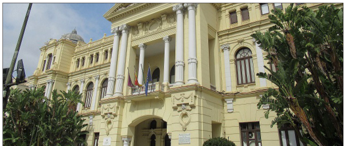
Fachada del Ayuntamiento de Málaga.