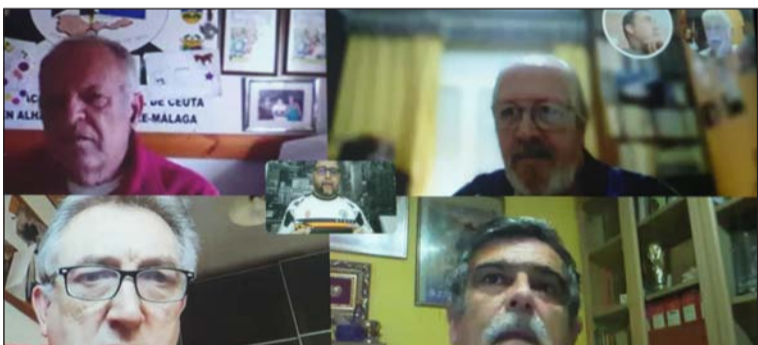
Captura de la videoconferencia.

Cádiz, Sevilla, Algeciras, Málaga, y Granada mantenían una reunión telemática para conocer la situación de cada una de ellas y unir criterios.