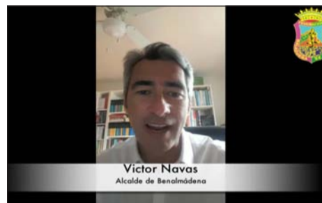
Víctor Navas Alcalde de Benalmádena