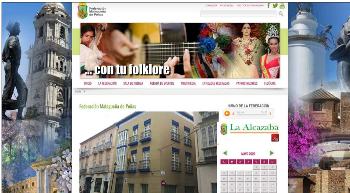
Página web de la Federación Malagueña de Peñas, en la dirección www.femape.com.