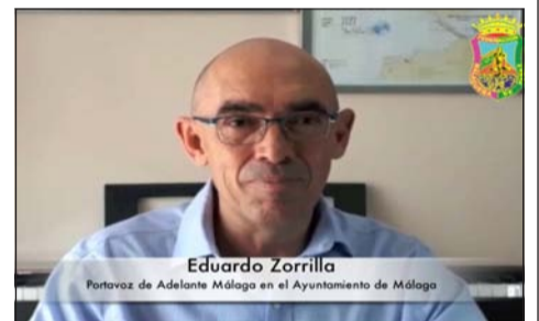
Eduardo Zorrilla Portavoz de Adelante Málaga en el Ayuntamiento de Málaga