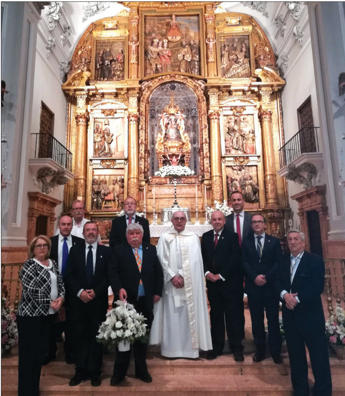
Ofrenda floral realizada en Mayo de 2019 ante Santa María de la Victoria.