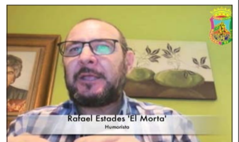
Rafael Estades 'El Morta' Humorista