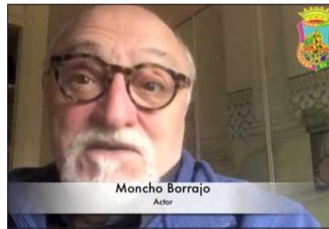
Moncho Borrajo Actor