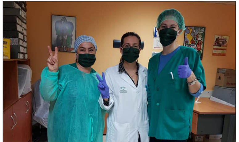
Personal sanitario con mascarillas confeccionadas por Hanuca.

A través de esta última donación se ha podido contribuir en la recogida de alimentos a cambio de una mascarilla. Así, desde la entidad se quiere mostrar su gratitud y reconocimiento a todo los voluntarios.