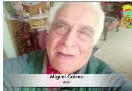
Miguel Caiceo Actor