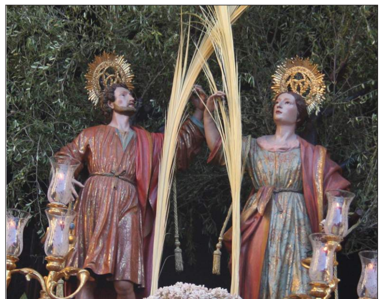
Imagen de la procesión del pasado año.