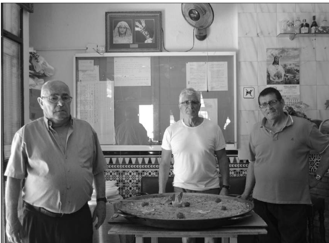
Preparativos de la comida de hermandad.