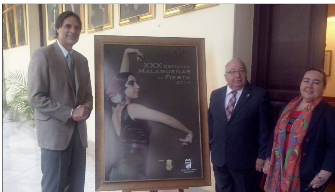
Presentación del cartel en el Ayuntamiento de Málaga.

La Peña El Palustre ha presentado las bases del Concurso del Colegio de Arquitectos de Málaga para el cartel Anunciador del 48 Concurso de Albañilería de esta entidad federada. Se pueden presentar obras hasta el 30 de junio.