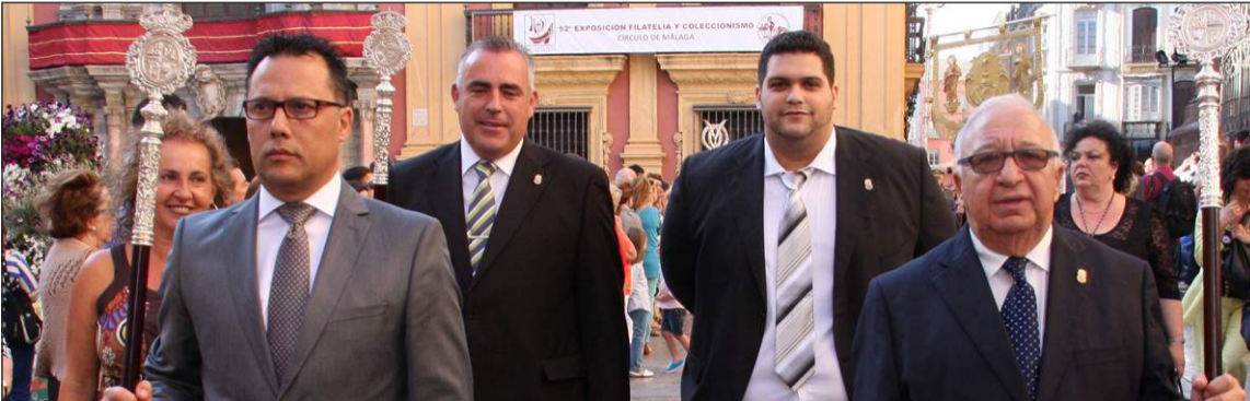
Representación corporativa de la Federación de Peñas en la procesión de 2013.