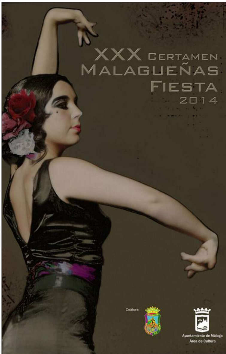
Cartel realizado por Fernando Wilson.