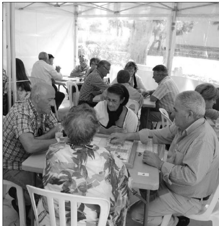
Partidas de parchís en la edición de 2013.

ción de personas con discapacidad, así como acortar distancias y conseguir que todos los que forman parte de este colectivo sean vistos con los mismos ojos por la sociedad. Este evento deportivo con templaba tres pruebas de atletismo en las que se corrieron 500, 1.500 y 5.000 metros. Como novedad, en esta edición, se amplían las categorías, tres primeros clasificados de cada categoría tendrá lugar el recorrido de 5.000 metros. La Carrera fue cronometrada por jueces de la Federación