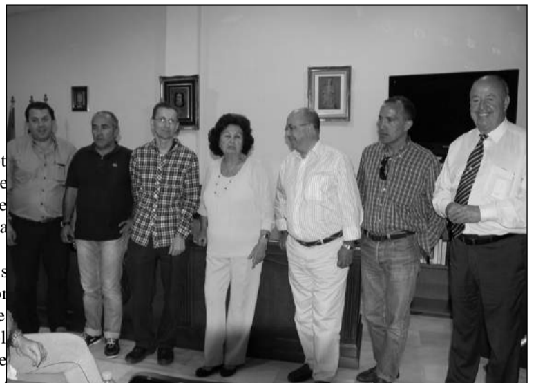
Los visitantes descubrieron la labor de la Escuela de Copla.