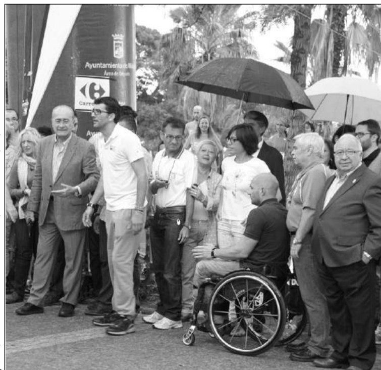
Salida de la prueba.

Una vez finalizadas las com- Una vez finalizadas las com- De este modo, hay algunas peticiones, que se desarrollarán en los jardines del Centro Cívico, se procederá a la entrega de trofeos en un acto que contará con la presencia de autoridades y que se desarrollará en una de las salas interiores de la Diputación Provincial de Málaga.