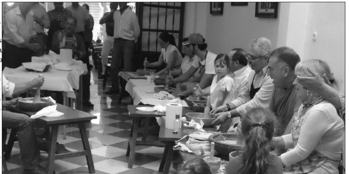
Los participantes cantaron un fandango antequerano mientras majaban la porra.

A esa hora, ya estaban prepa- variante del gazpacho, que rados todos los ingredientes forma parte del recetario tradi- necesarios para la realización de la ciudad malagueña