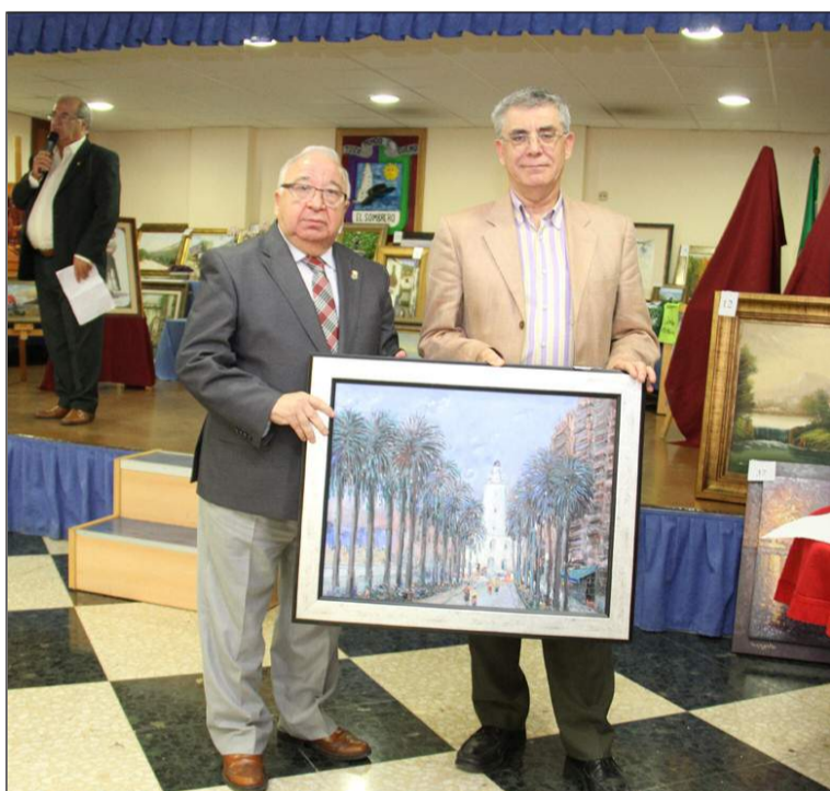
Cuadro adquirido por la Federación de Peñas para colaborar.