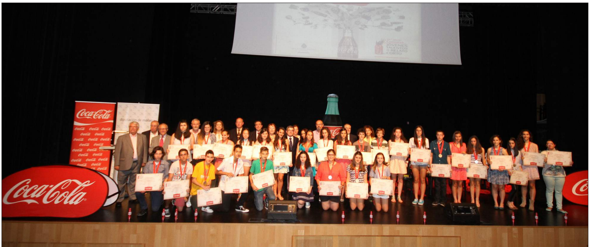
Los galardonados posan con su diploma.

profesor de literatura es el encargado de practicar el relato corto en clase y seleccionar a los alumnos que representarán al colegio en el concurso. La prueba escrita, en la que participan miles de estudiantes, tiene lugar simultáneamente en toda España, con un estímulo narrativo diferente en cada edición.