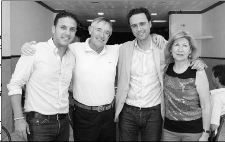
Las autoridades del distrito, director y concejal, estuvieron presentes.