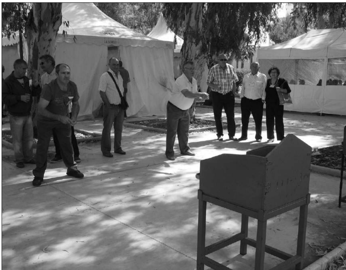
Lanzamiento a la Rana, una de las disciplinas de las Olimpiadas de Juegos de Peñas.