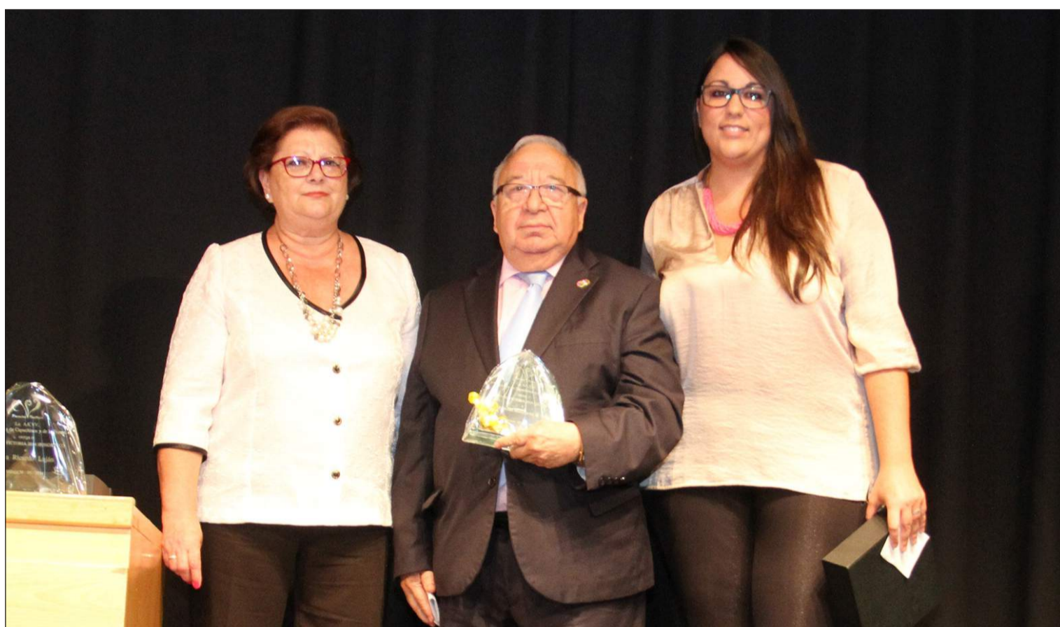
Entrega del galardón en el transcurso de una gala celebrada el pasado 30 de mayo.

Número 551 4 de Junio de 2014 C/ Pedro Molina, 1 Tfno: 952 22 54 39 Fax: 952 21 48 82 E-mail: prensa@femape.com - la_alcazaba@hotmail.com Web: www.femape.com Edición digital: www.femape.com/laalcazabadigital Twitter: @FMPLaAlcazaba Búsquenos también en Facebook