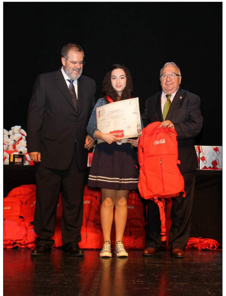
Entrega de uno de los premios.

premiado con la asistencia a la gran Gala Nacional en la sede de la Real Academia Española el 27 de junio. En este sentido, una de las novedades de esta edición es la colaboración de esta Institución en su III Centenario.