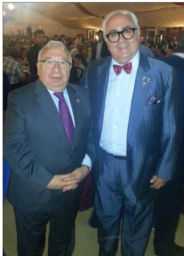
El presidente de la Federación, con el señor Font.