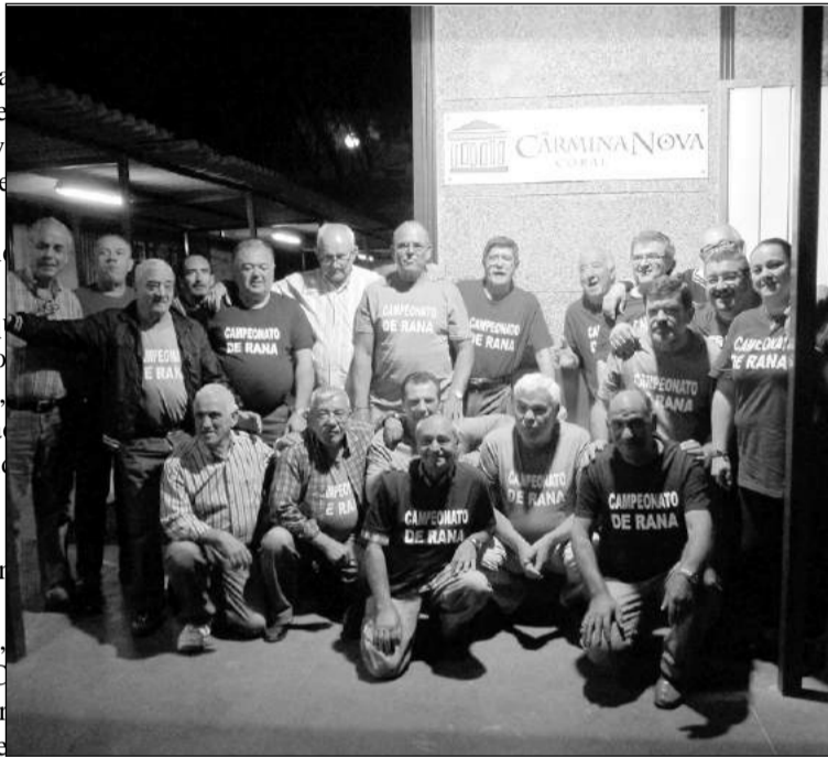
Participantes de las diferentes entidades

Después de la entrega de premios se procederá a tomar unos aperitivos, entre participantes y familiares directos.