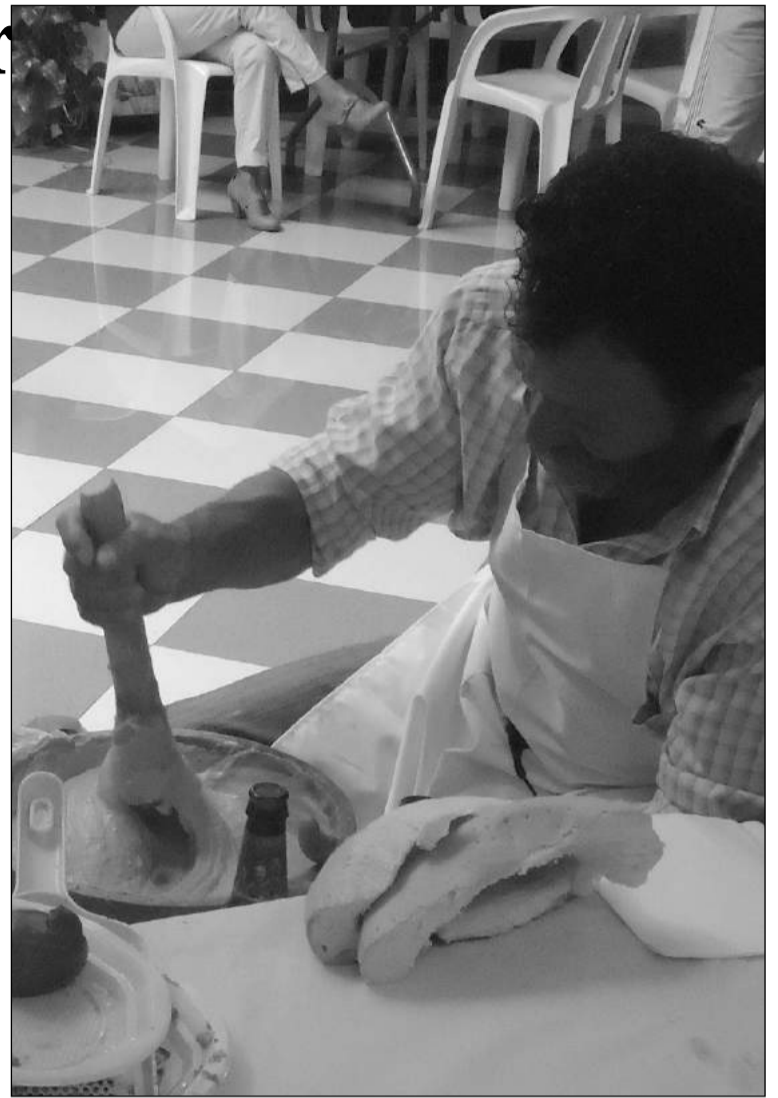
Uno de los participantes, realizando la porra.