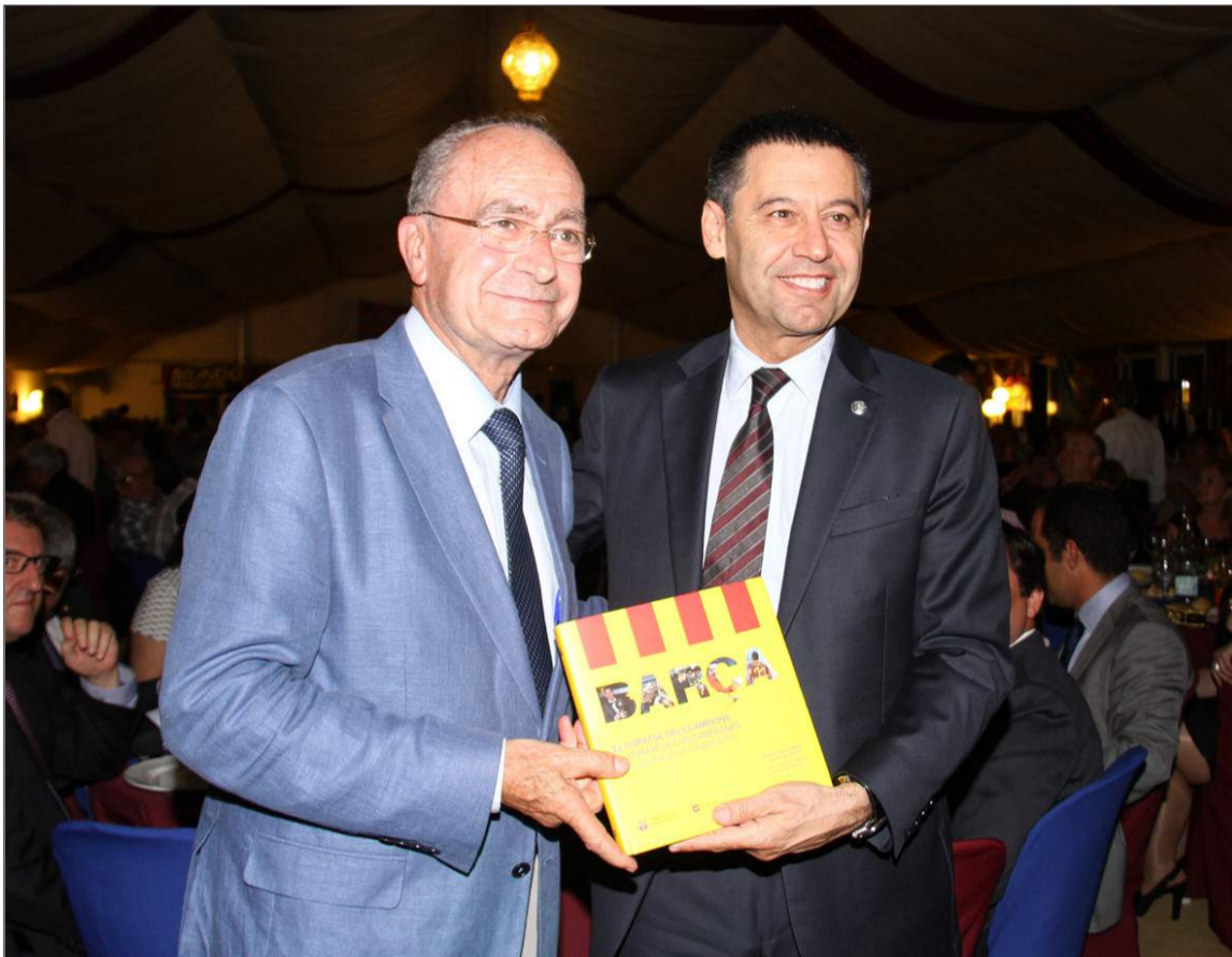
El presidente del Barcelona entrega un recuerdo al alcalde de Málaga.

La capital de la Costa del Sol acogió los días 30 y 31 de mayo y 1 de junio del XI Congreso de Peñas Barcelonistas