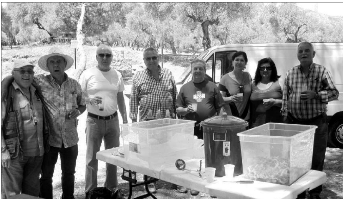
Algunos de los asistentes a esta comida campestre.