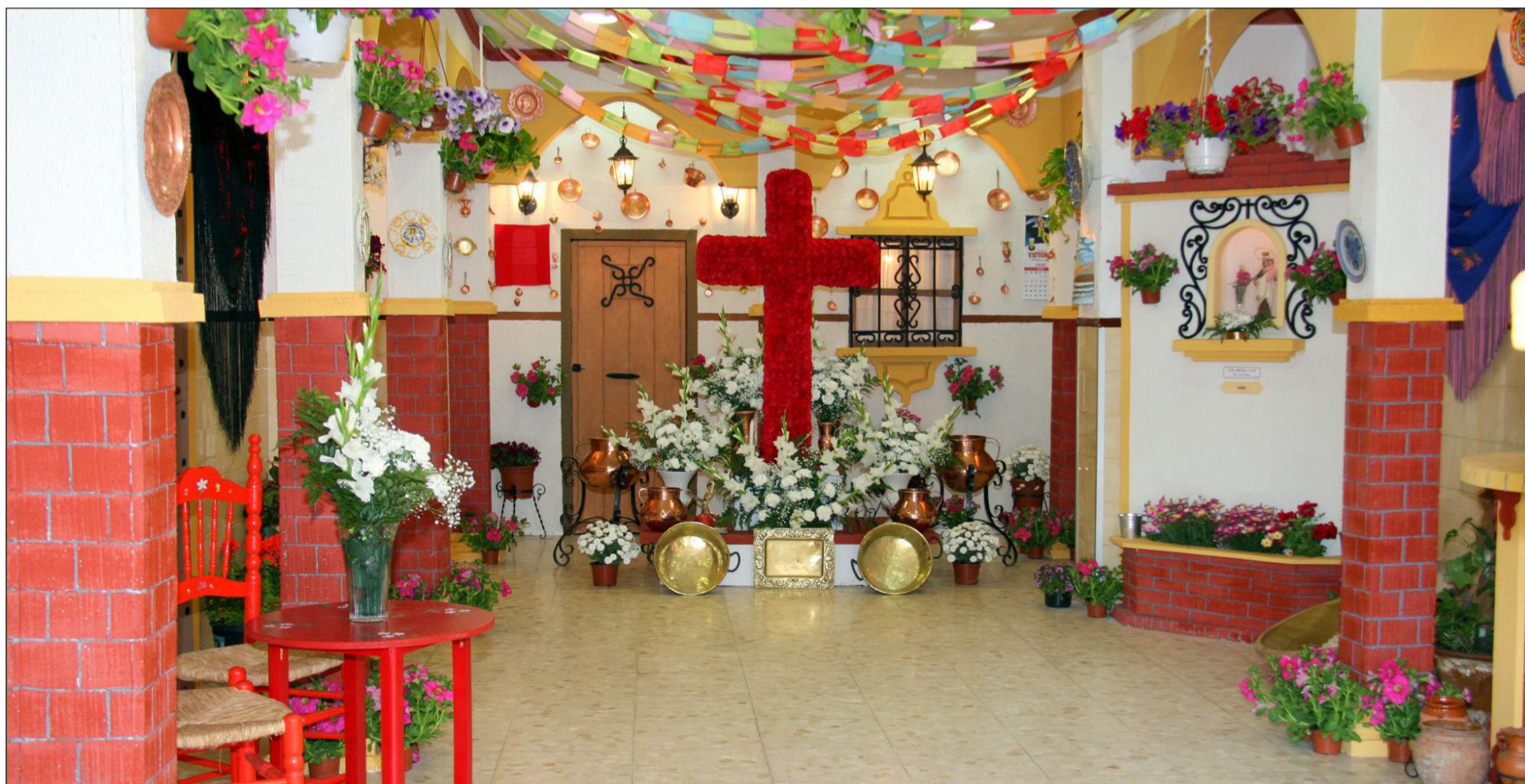
Cruz de Mayo de la Peña Costa del Sol, vencedora del certamen del pasado año.

La entidad que no esté representada en la entrega de premios del 24 de mayo no tendrá derecho al premio, trofeo y recuerdo de participación.