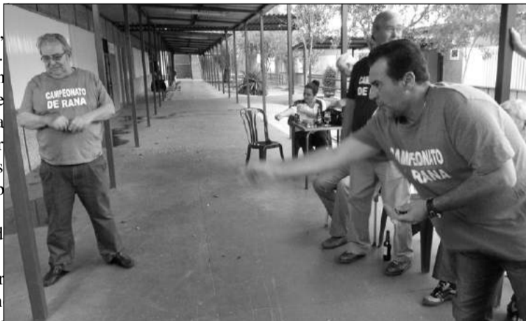
Un instante de una de las partidas.