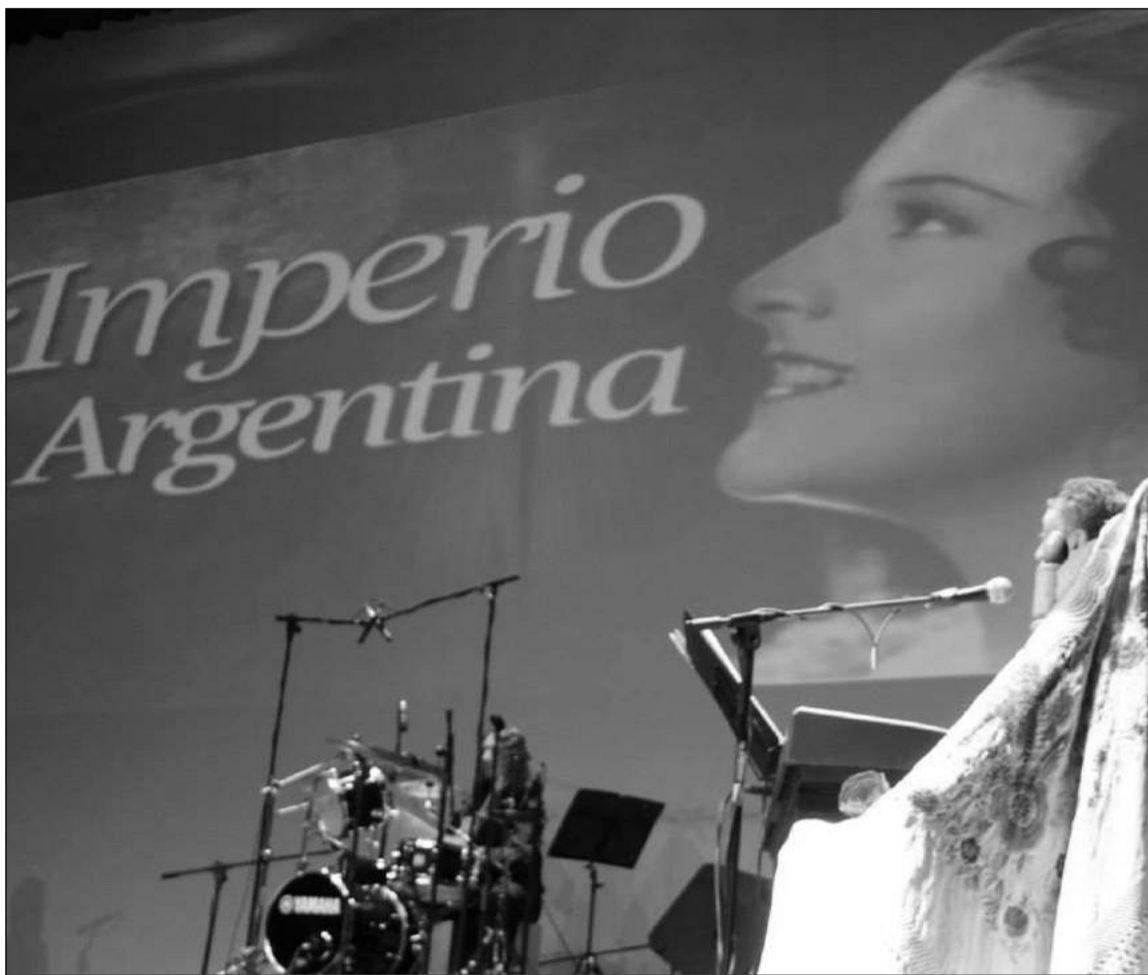
‘Eternamente Malena’ fue un gran homenaje a Imperio Argentina.