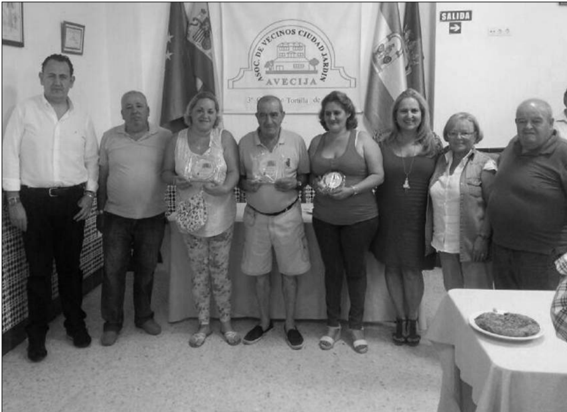
Acto de entrega de premios.