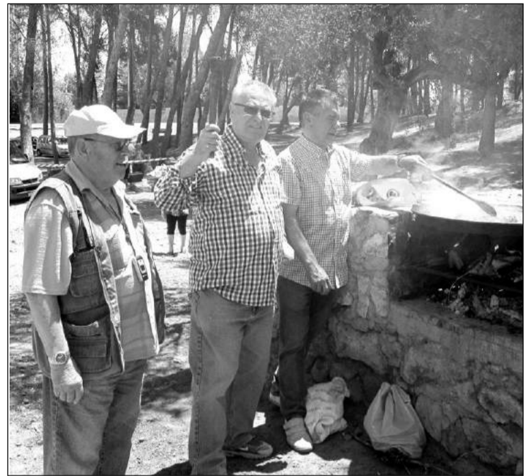
Preparativos de la paella.