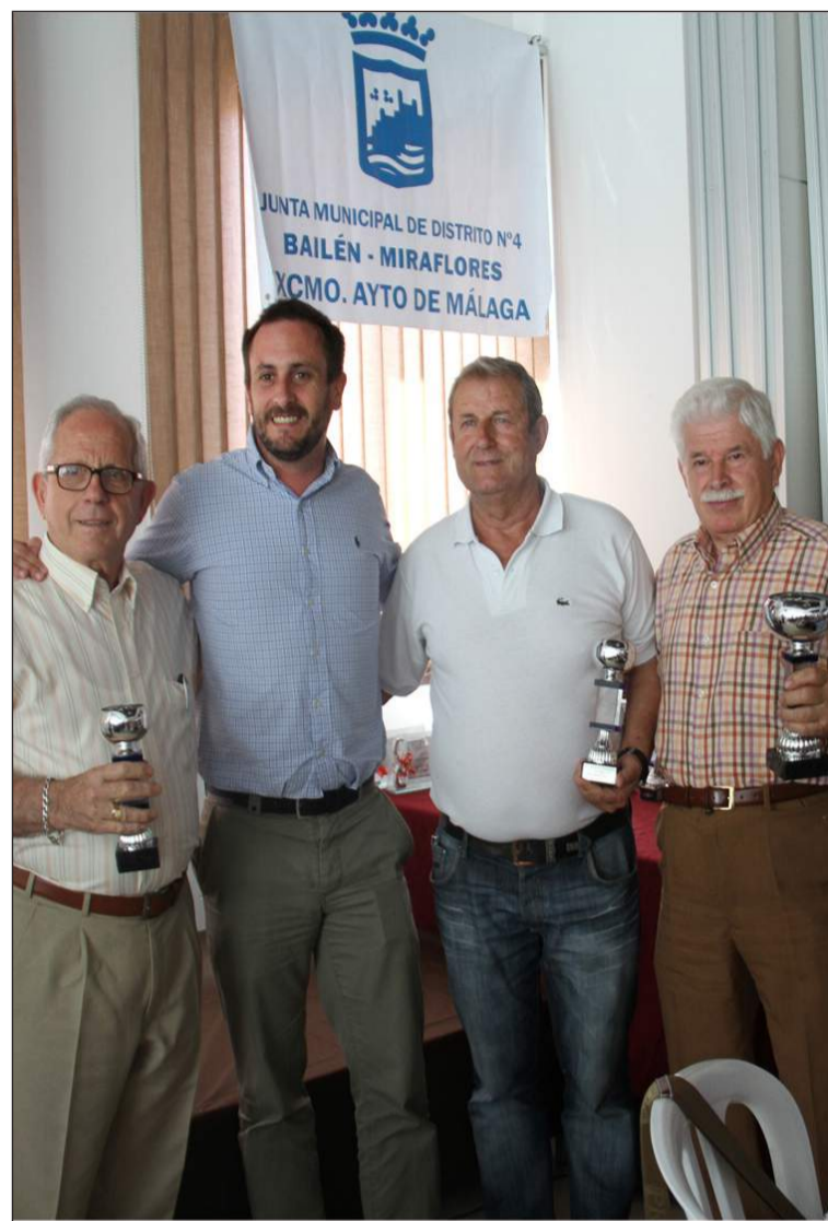
Trofos en la categoría de dominó.