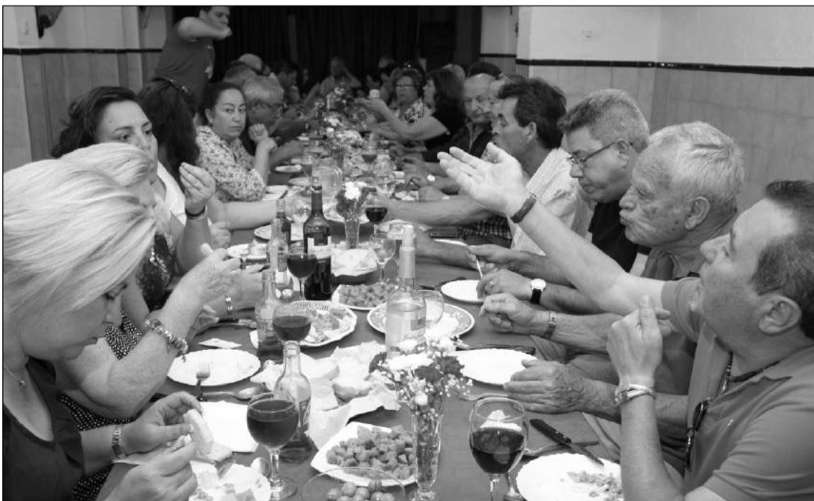
Algunos de los asistentes al almuerzo.