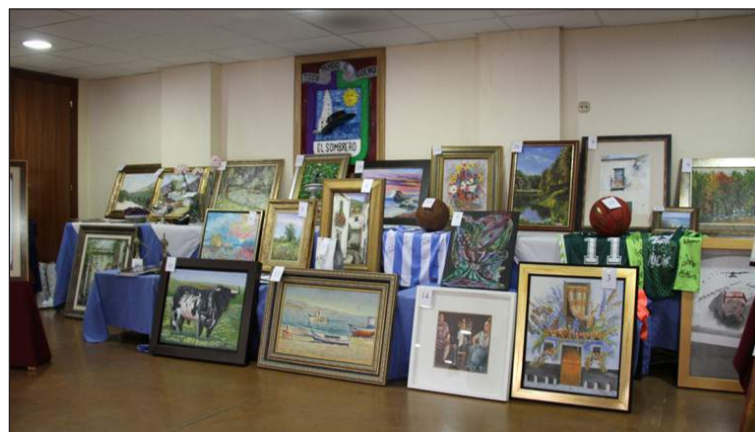
Algunas de las obras que salieron a subasta.

Diferentes artistas colaboraron con la cesión de sus obras, que fueron subastadas entre los asistentes a esta actividad tan tradicional.