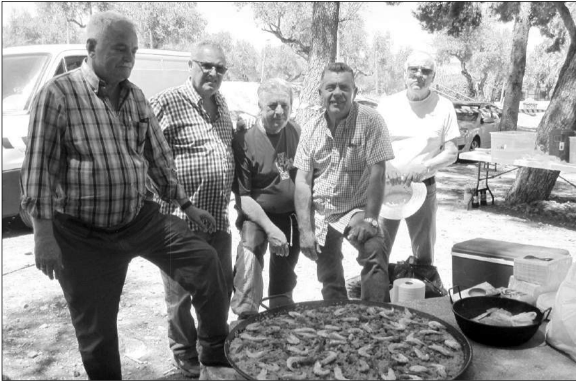
Encargados de realizar la comida para los socios asistentes a esta convivencia.