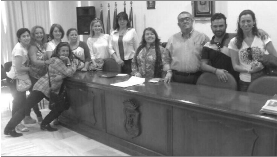
Profesores reunidos en el salón de actos de la Federación de Peñas.