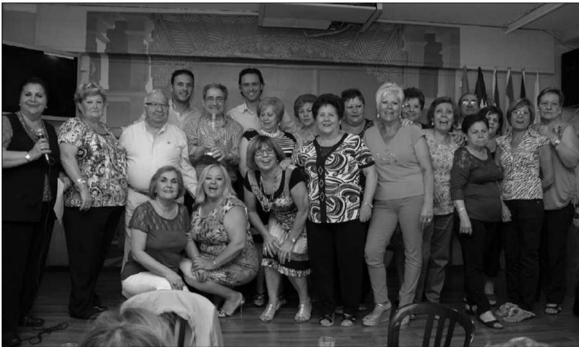
Entrega de premios a los participantes.