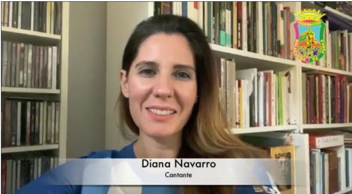
Diana Navarro Cantante

La cantante Diana Navarro, luciendo la camiseta del Málaga Club de Fútbol.