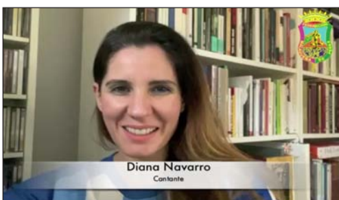
Diana Navarro Cantante