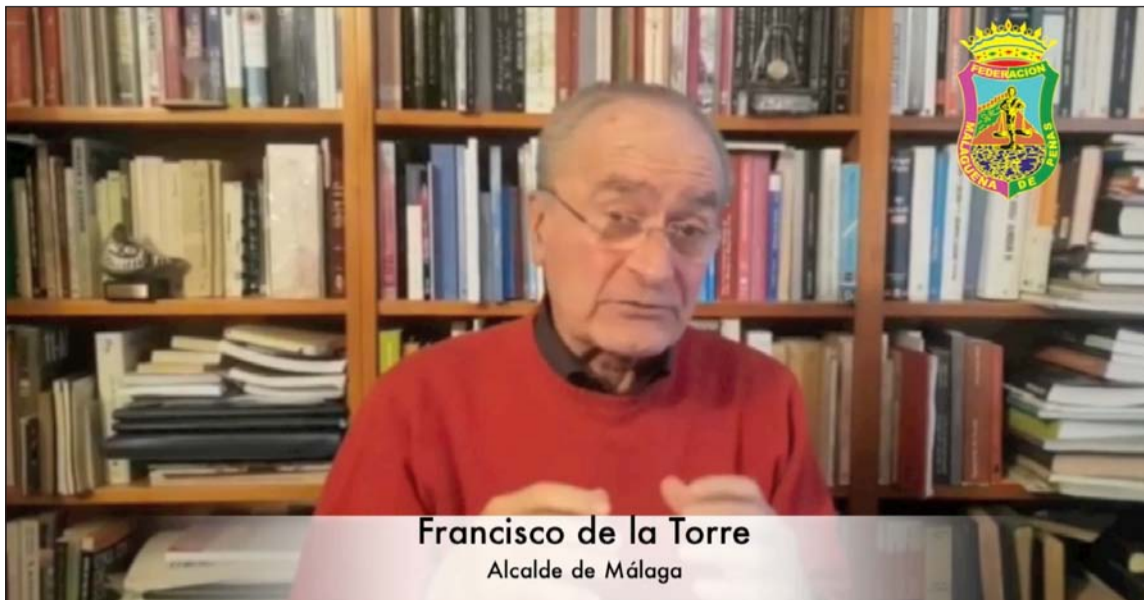
Francisco de la Torre Alcalde de Málaga

Vídeo remitido por el alcalde, Francisco de la Torre.