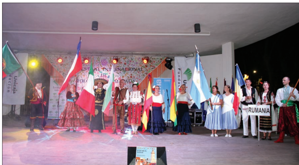
Imagen de archivo de la edición anterior del Festival, con la presentación de los grupos participantes.

Este festival no se celebraba en nuestra capital desde el año 2011, y su recuperación tuvo un resultado espléndido al contar con un gran respaldo de los malagueños.