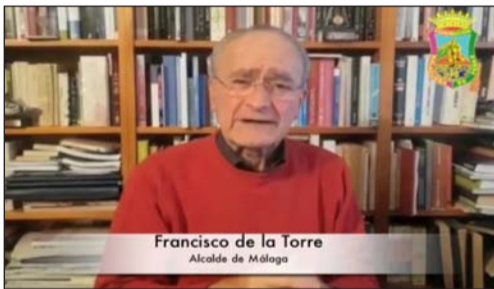
Francisco de la Torre Alcalde de Málaga