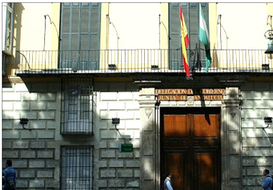
Sede de la Delegación del Gobierno de la Junta de Andalucía en Málaga.

De este modo, se solicita relación de presidente, Junta Directiva, teléfonos, email, direcciones, o personas de contactos.