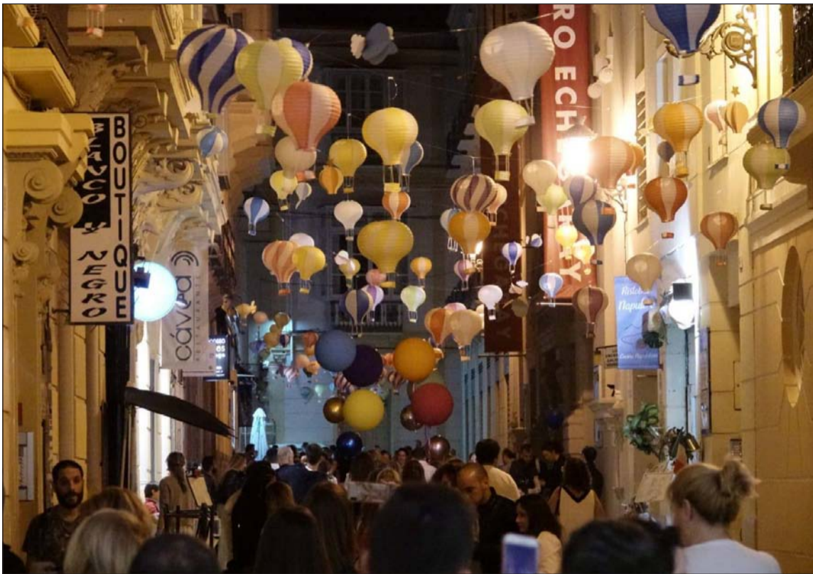
Grupo de socios en la primera de las visitas realizada en colaboración con Zegrí.