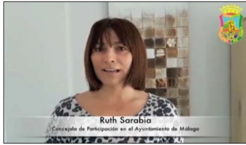
Ruth Sarabia Concejala de Participación en el Ayuntamiento de Málaga