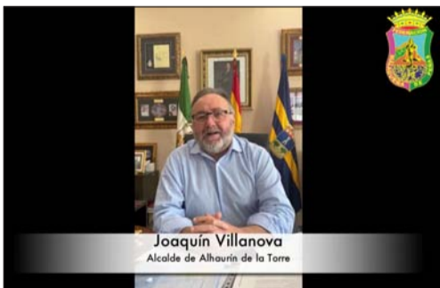
Joaquín Villanova Alcalde de Alhaurín de la Torre