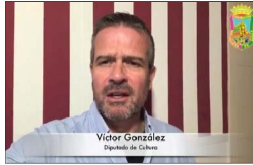
Víctor González Diputado de Cultura