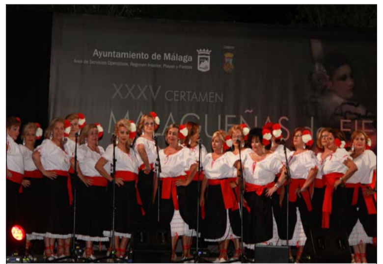
Uno de los coros participantes en el certamen del pasado año.

A la espera de ver la evolución de la situación en la que nos encontramos por la pandemia de Coronavirus, se confía poder comunicar en las próximas semanas las nuevas fechas tanto de la inscripción como de la celebración del Certamen.