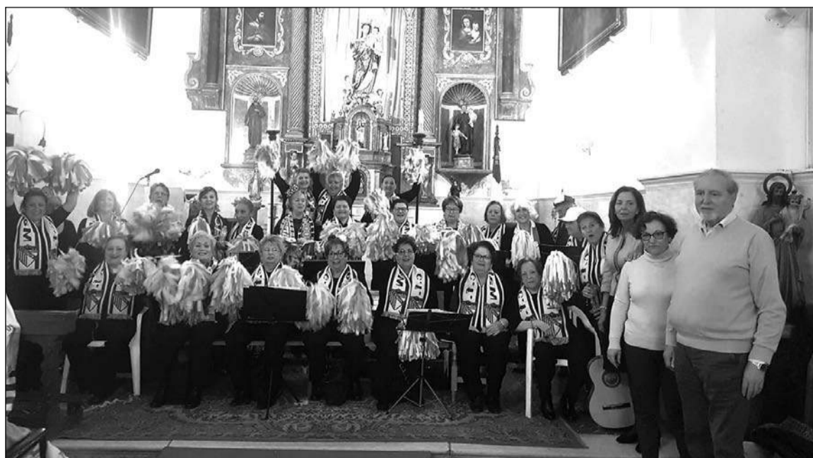
Coros y miembros de la junta directiva en el Asilo de los Ángeles.