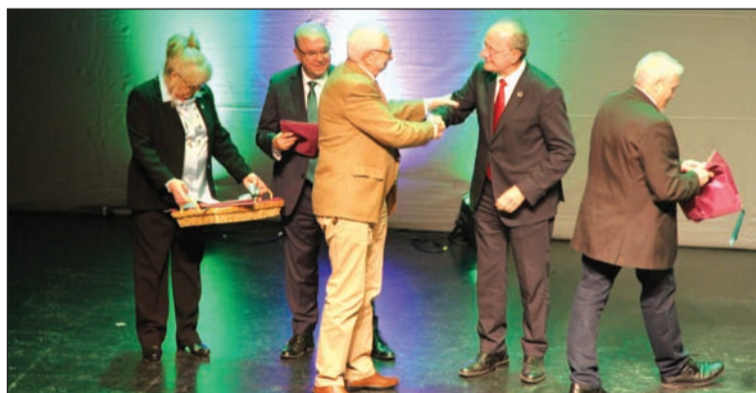
Entrega de banderas de la Ciudad por el alcalde Francisco de la Torre.

Finalmente, el alcalde de Málaga, Francisco de la Torre, era el encargado de entregar las banderas de la Ciudad, poniendo colofón al capítulo de intervenciones.