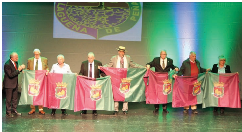
Entrega de banderas a las entidades federadas con motivo del Día de Andalucía, el pasado 28 de febrero en el Auditorio Edgar Neville de la Diputación de Málaga.