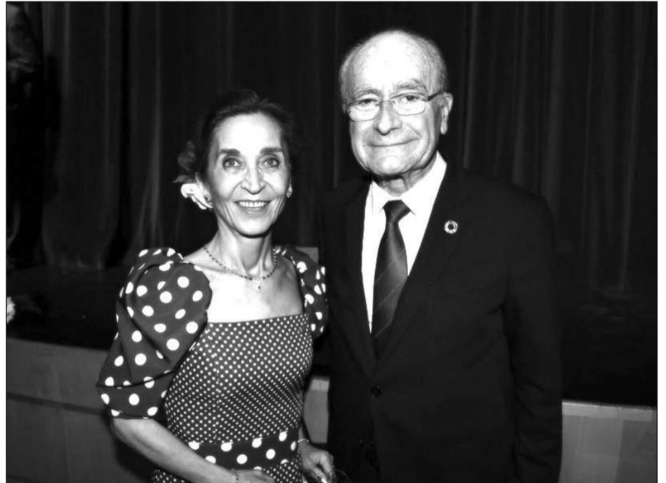
La pregonera, con el alcalde de Málaga, Francisco de la Torre.