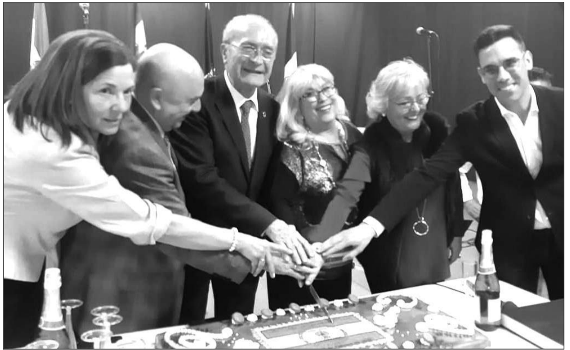
Corte de la carta del aniversario.