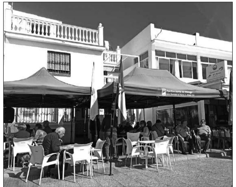
Exterior de la sede de la Peña el pasado 28 de febrero.

Por otra parte, para el 20 de este mismo mes hay convocada una Asamblea General