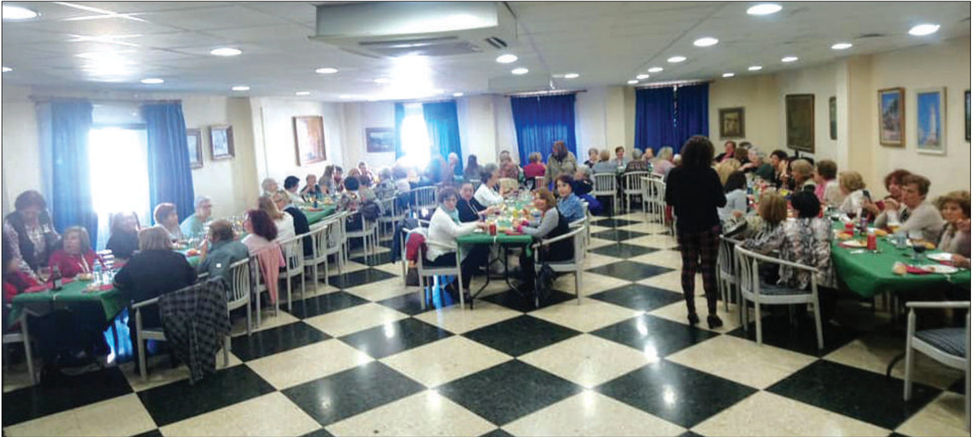
Vista general del salón Miguel de los Reyes de la Peña El Sombrero durante la Comida de Mujeres del pasado mes de febrero.