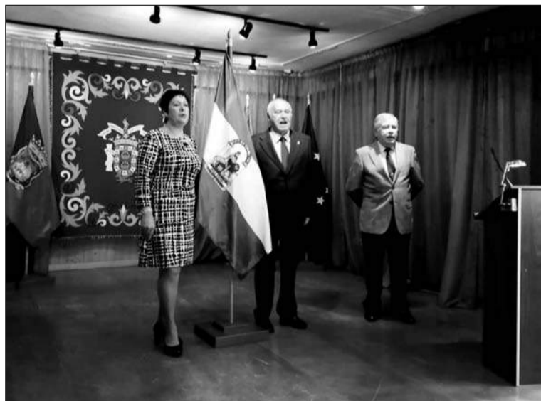
Un momento del acto del Día de Andalucía.