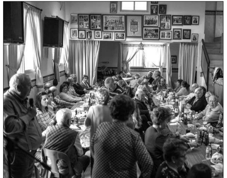
El presidente se dirige a los peñistas que llenaron la sede.