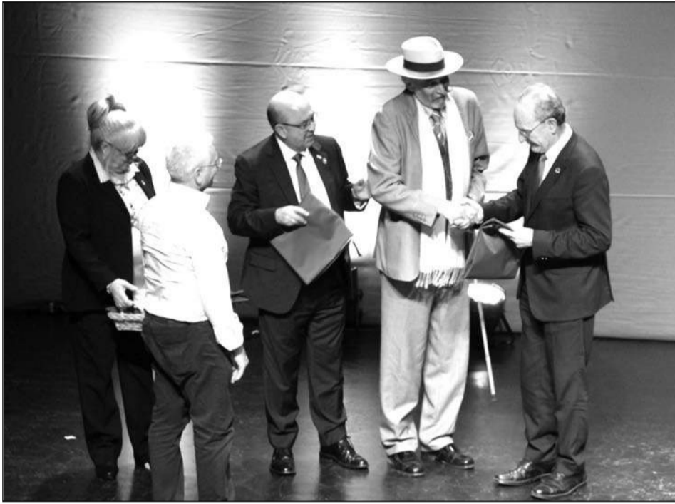
Entrega de banderas de la Ciudad de Málaga.