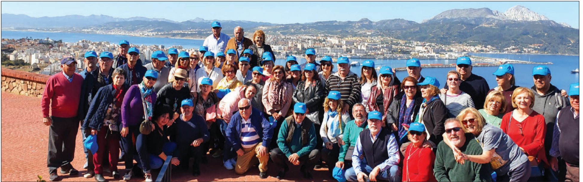
Los peñistas, con la Bahía de Ceuta al fondo.

expedición, que hacían entrega de una placa en agradecimiento a la hospitalidad mostrada.