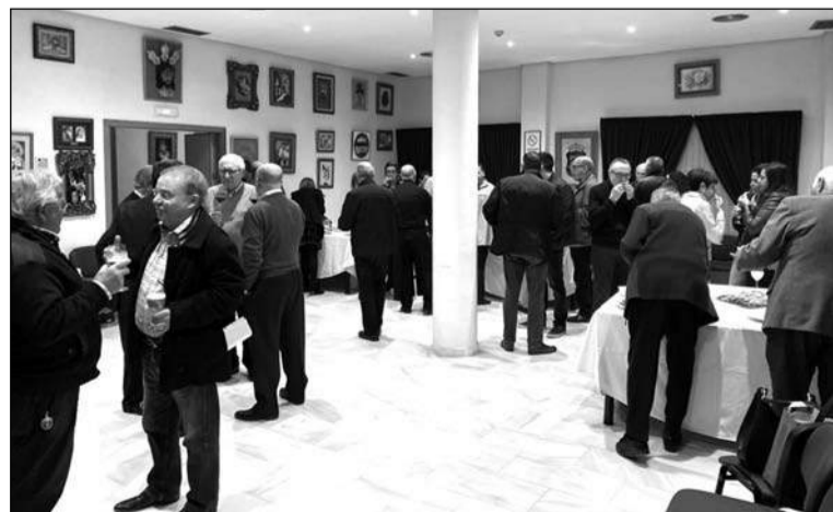
Socios comparten un aperitivo en la sede de la Federación tras la asamblea.

A continuación se servía un aperitivo en la planta baja del edificio peñista, en un acto de confraternidad entre los componentes de esta asociación que realiza en grueso de sus actividades en la Feria de Málaga, contando con una de las casetas más emblemáticas del recinto de Cortijo de Torres.