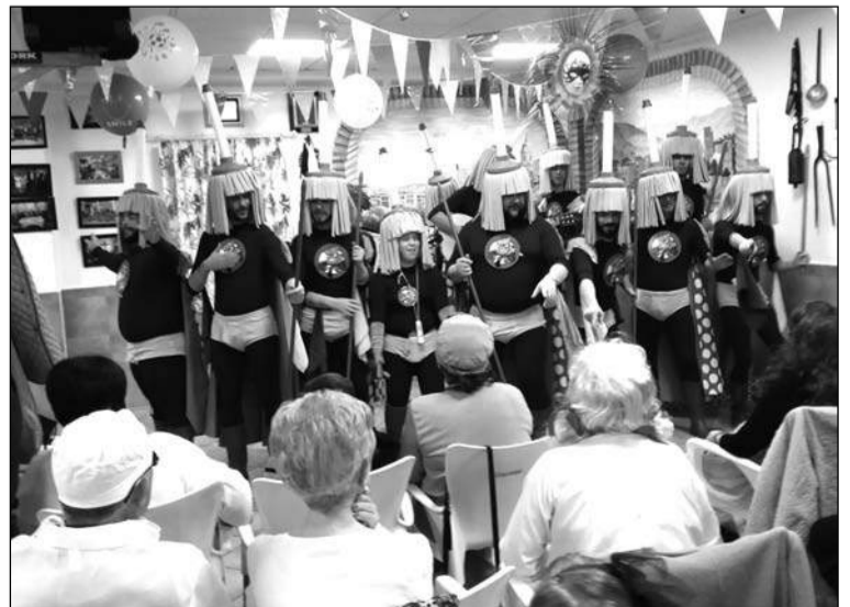
Un momento de la actuación.