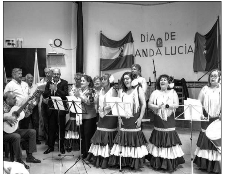
Intervención del coro.

El postre lo ponía el Coro Espuma y Sal de esta entidad perteneciente a la Federación Malagueña de Peñas, Centros Culturales y Casas Regionales 'La Alcazaba', cantando malagueñas, rumbas y para terminar el himno de Andalucía.