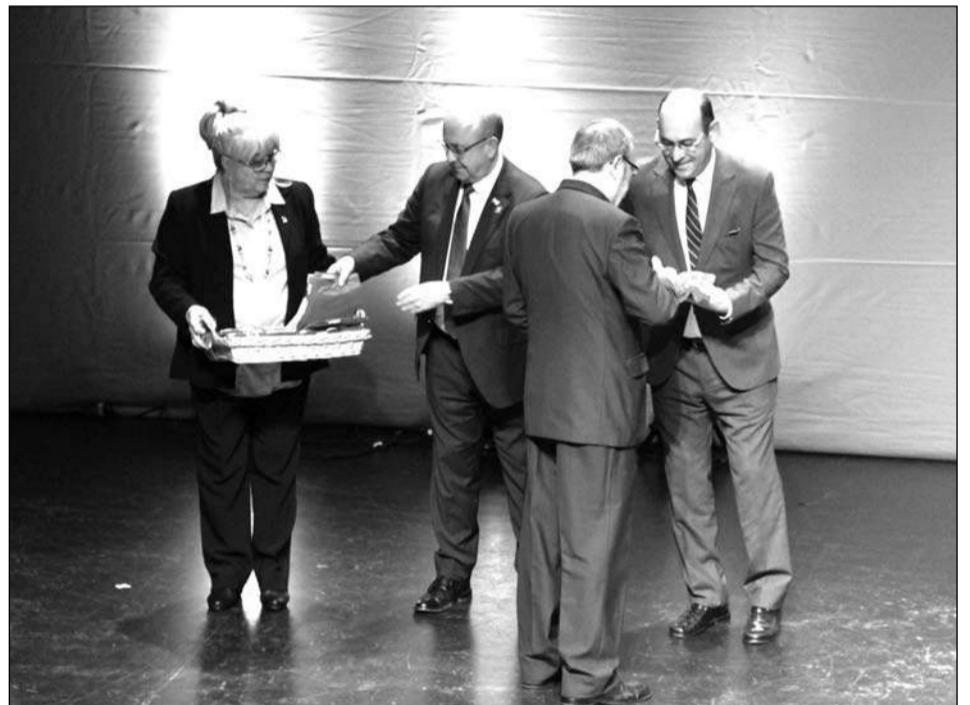
El Comandante Naval Ignacio García de Paredes entrega las banderas de España.