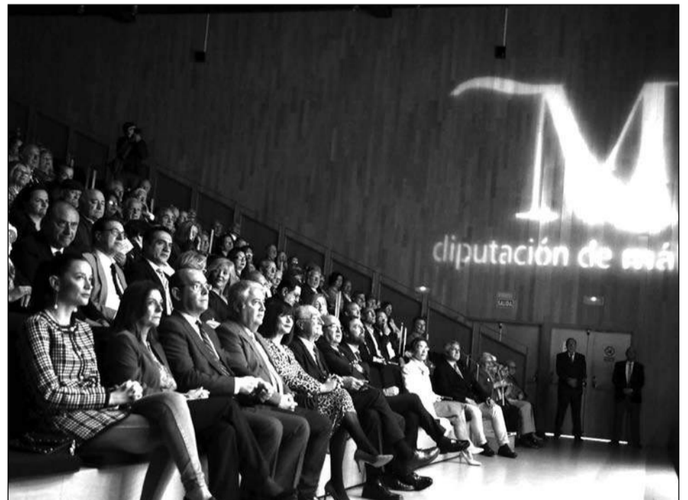
Público que llenó el Auditorio Edgar Neville.