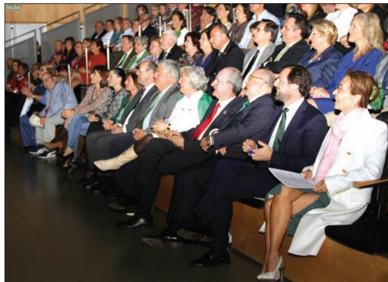
Asistentes al acto.