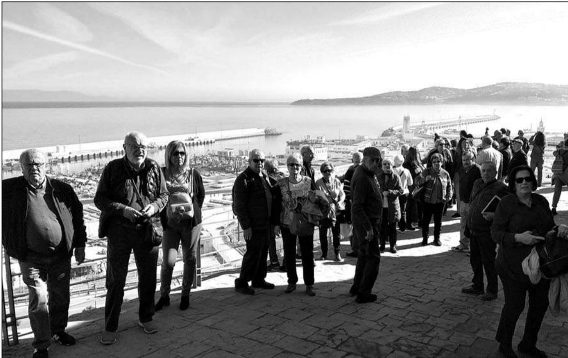
Socios en Marruecos, a su llegada al puerto de Tánger.

De cara a la Semana Santa, la entidad organiza su Exaltación en la Iglesia Virgen del Camino el 28 de marzo a las 12.30 horas.