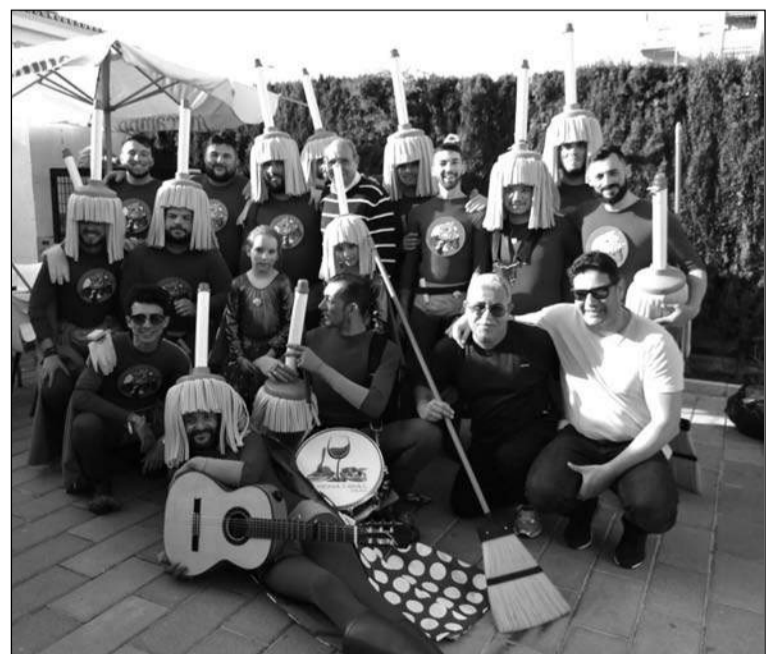
Murga 'A todo trapo'.