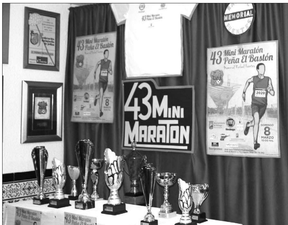
Presentación de esta edición, celebrada días atrás en la sede de la Peña El Bastón.

Desde la Peña El Bastón se espera comunicar a los corredores una nueva fecha en el menos plazo posible, para de este modo mantener la decana de las carreras populares que se celebran en toda la provincia de Málaga. La Federación de Peñas muestra su compromiso de colaboración para que la prueba siga con su actividad.