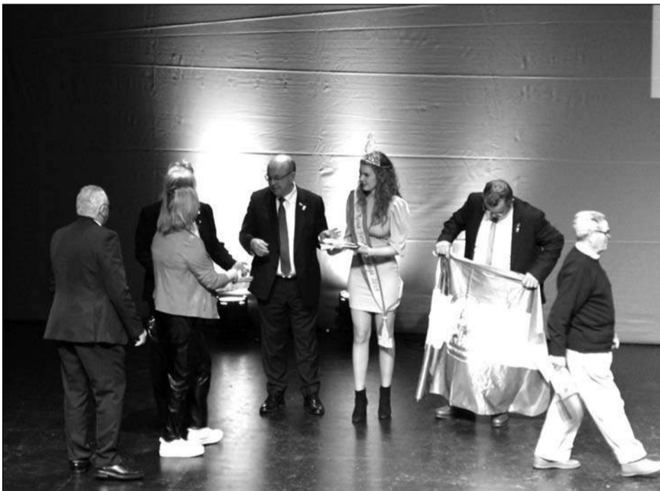
Entrega de banderas de Andalucía.