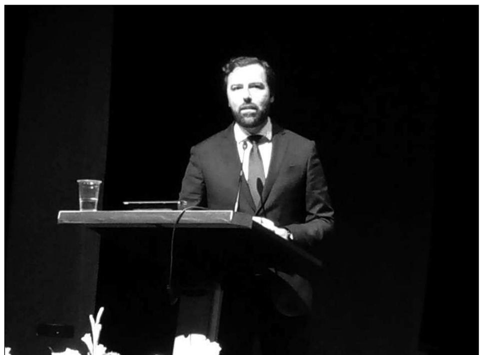
Intervención del diputado Juan de Dios Villena.