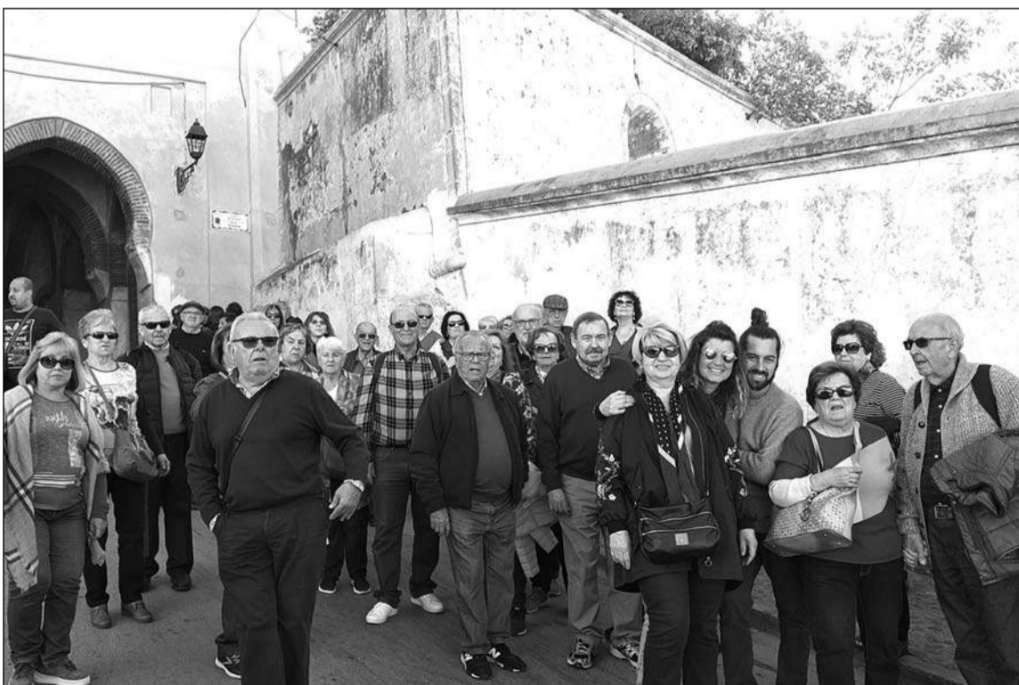
Imagen de grupo en Marruecos.