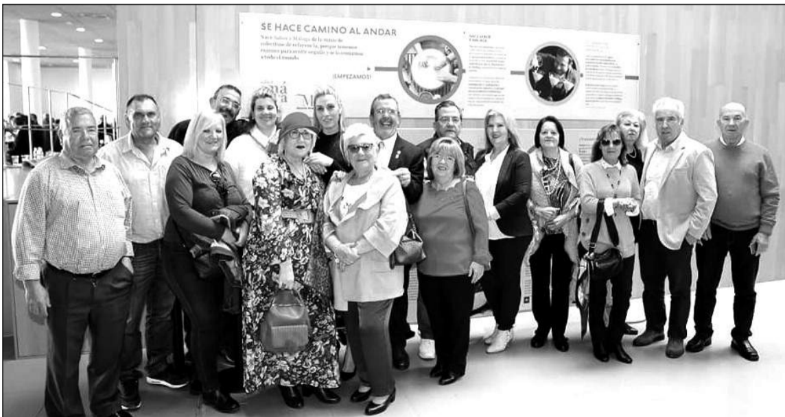
Socios en la sede de la Diputación, con su presidente Antonio Gutiérrez.