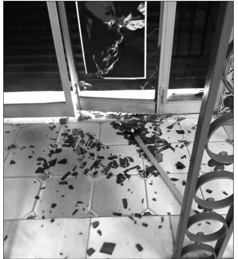
Dstrozos en la sede de la Peña Victoriana El Rocío

El colectivo se ha volcado en su repulsa a estos actos tan deleznable; mostrando a su junta directiva su solidaridad y apoyo..