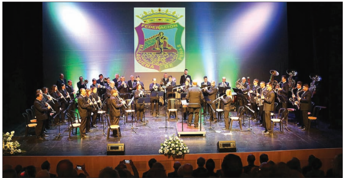
La Banda de Música Municipal interpreta los himnos.