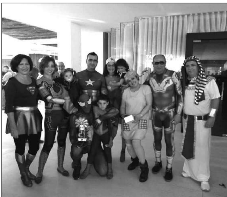
Socios disfrazados en el hotel de Roquetas.

Más de 130 socios disfrutaron de la jornada en la que también se aprovechó para hacer entrega de los trofeos de los campeonatos de parchís y de rana disputados con anterioridad.