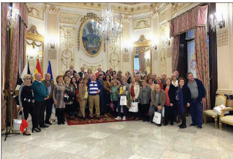
Recepción a los peñistas malagueños.

La iniciativa recibía el respaldo de los peñistas que, rápidamente, agotaron todas las plazas, y que de este modo disfrutaron de una actividad entrañable. Afortunadamente, el tiempo acompañó y posibilitó el disfrute de todos los participantes.