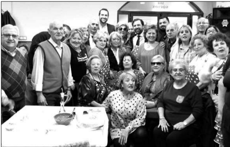
Autoridades y socios asistentes a esta actividad.