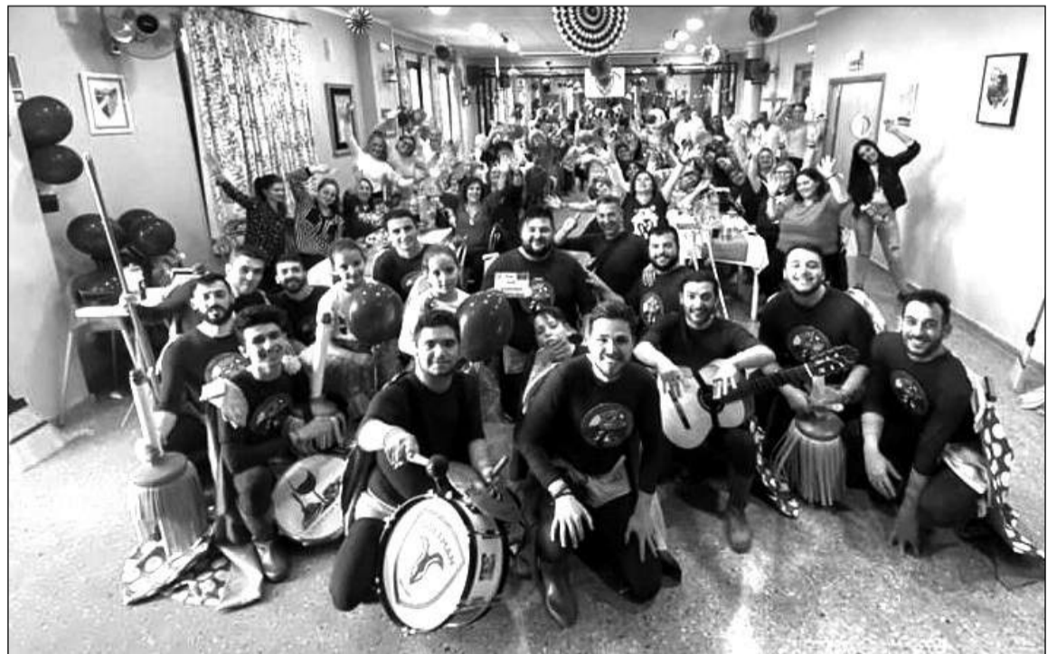
La murga 'A todo trapo', con todas las participantes en el Día de la Mujer.