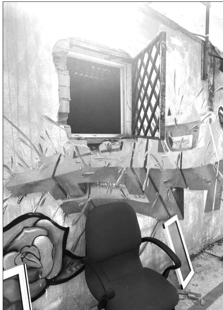
Ventana forzada para acceder a la sede de la Peña La Virreina.