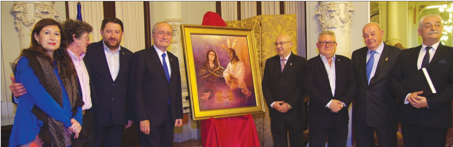
Presentación del cartel anunciador del XLV Concurso Nacional de Saetas en el Salón de los Espejos del Ayuntamiento de Málaga.