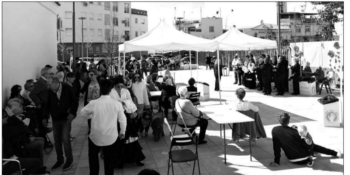
Celebración del Día de Andalucía.