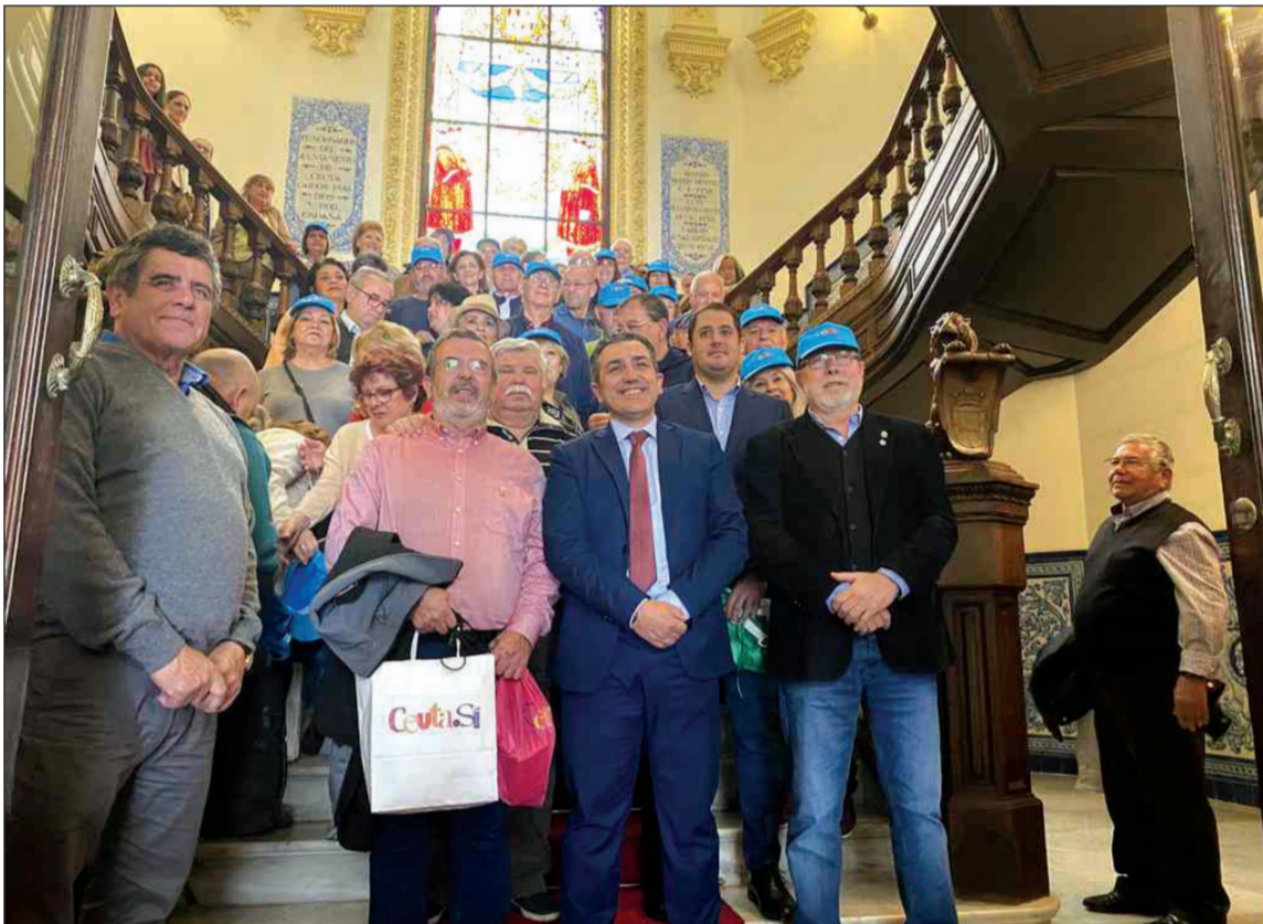
Grupo de peñistas en las escaleras del Palacio Autonómico.