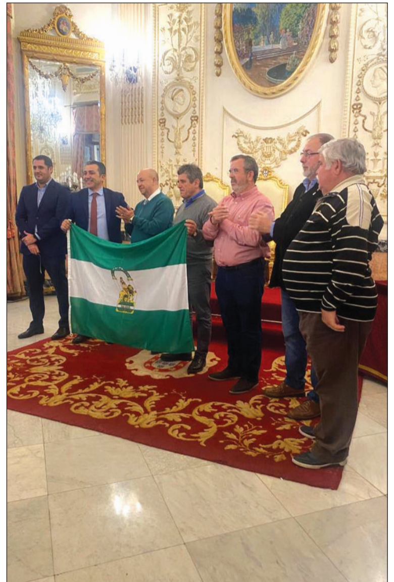
Entrega de una bandera de Andalucía.