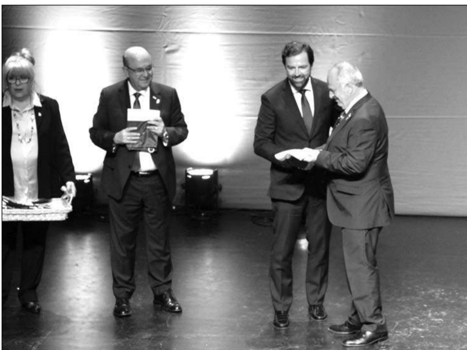
Entrega de banderas de la Diputación,