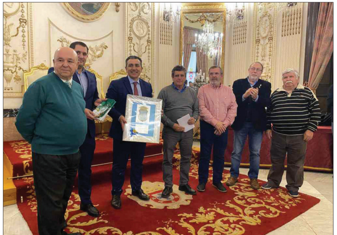
Miembros de la junta directiva entregan un recuerdo de la visita a las autoridades locales.