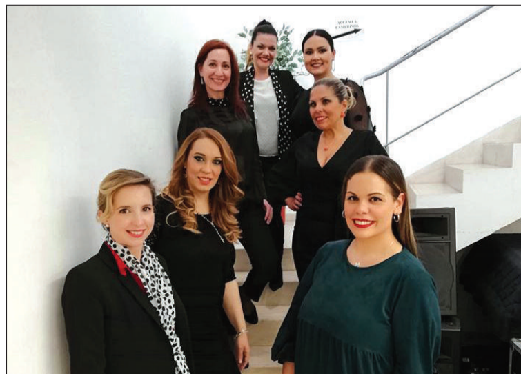
Participantes en la primera semifinal.

La gran final de este Concurso Nacional de Saetas tendrá lugar el domingo 29 de marzo a las 19 horas en el Teatro Cervantes.