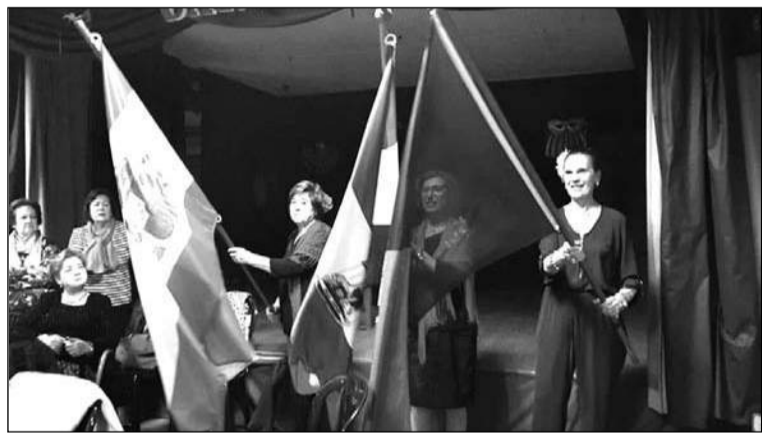
Celebración del Día de Andalucía.