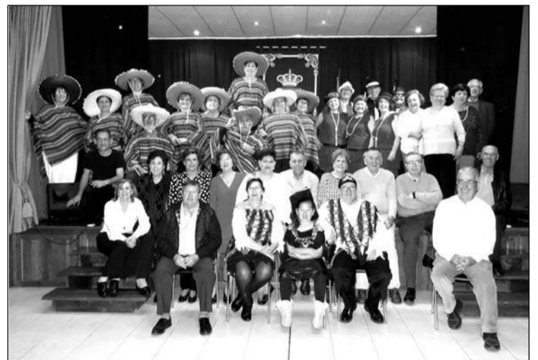
Fiesta de carnaval.