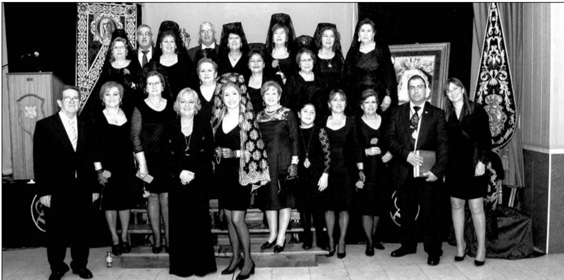
Exaltación de la Semana Santa.