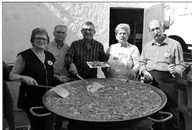
Preparativos de la paella.