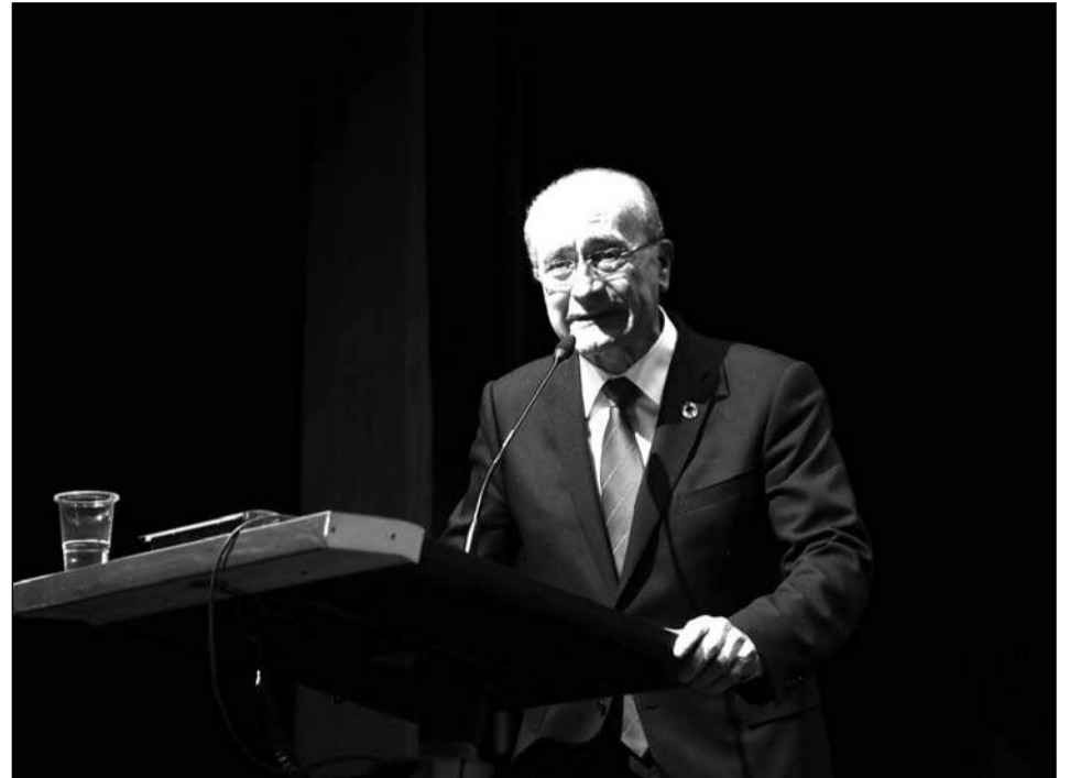
Intervención del alcalde, Francisco de la Torre.