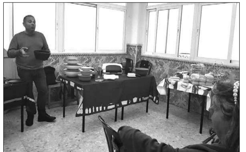
Nombramiento de la pareja del año.

La Peña Nueva Málaga celebra el pasado 19 de febrero un taller de cocina sobre los beneficios de la comida alcalina, que fue del interés de los socios de esta entidad integrada en la Federación Malagueña de Peñas.