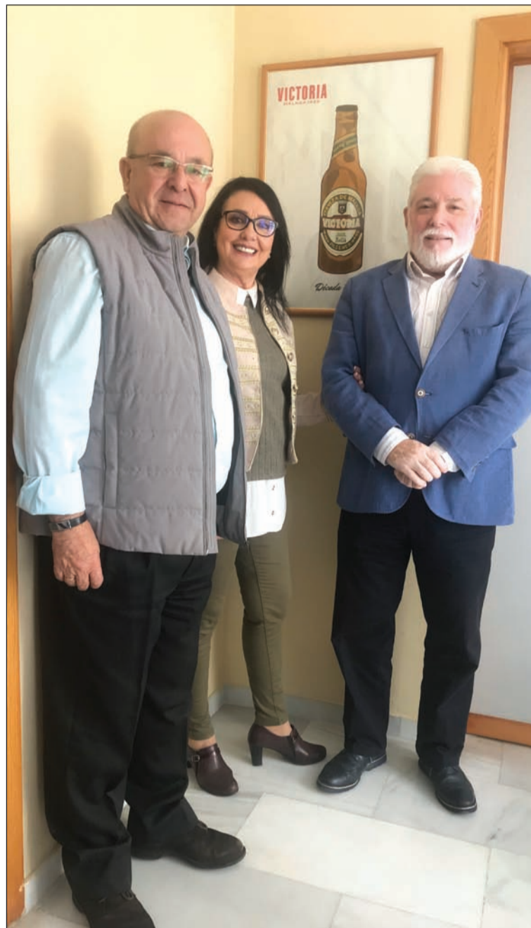
Visita de los representantes de la Federación de Peñas Cordobesas a Málaga.

Aún hay otro viaje destacado a Córdoba, en el que la Federación Malagueña hacía entrega de una imagen de la Virgen del Carmen. Fue procesionada por el entorno de la Mezquita, y posteriormente embarcada por el río Guadalquivir el día de su festividad, el 16 de julio.