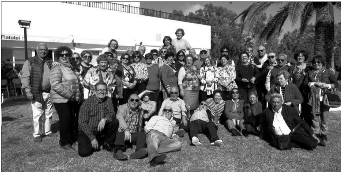
Socios disfrutan de unos días de descanso por San Valentín.