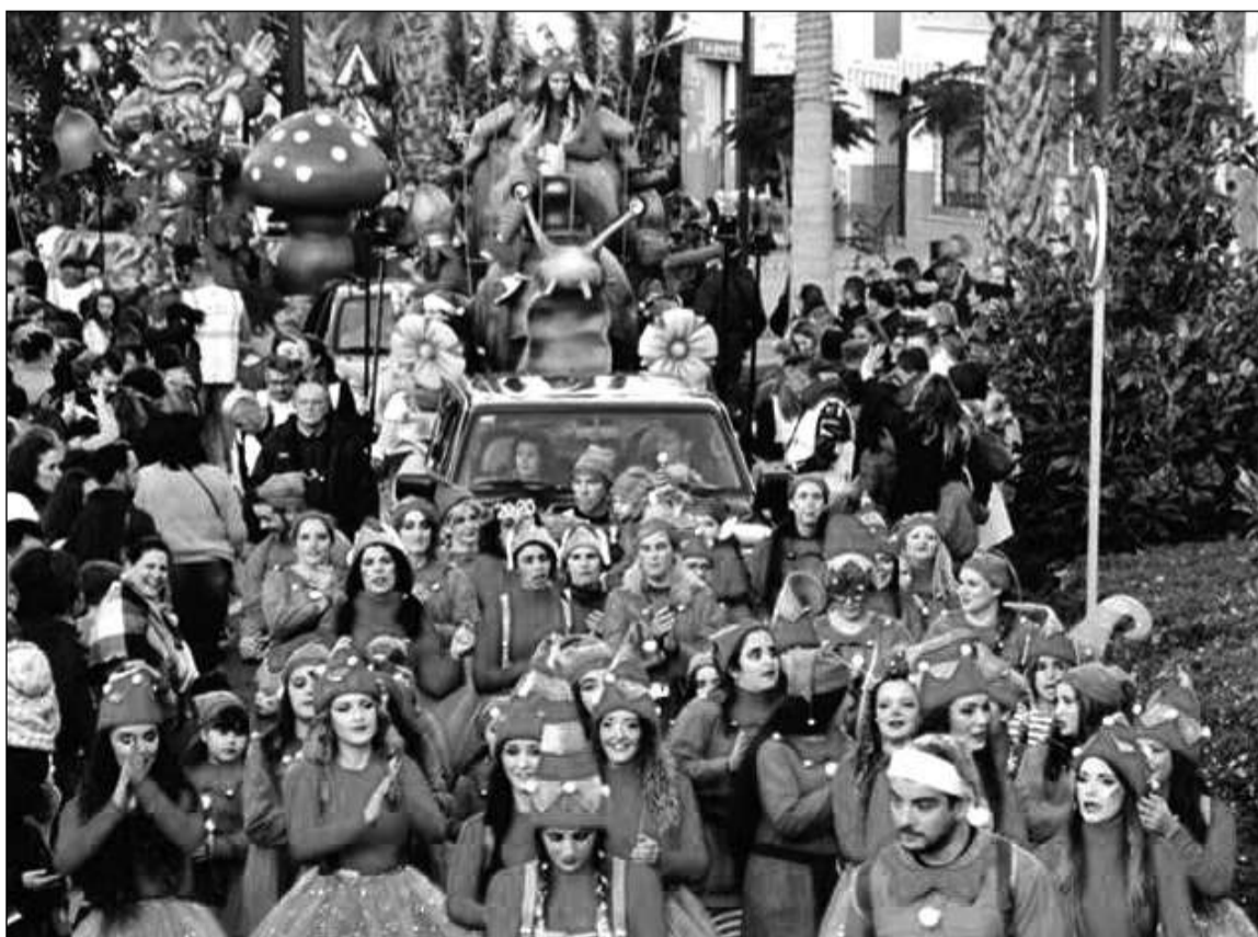
Integrantes de la asociación en la cabalgata.