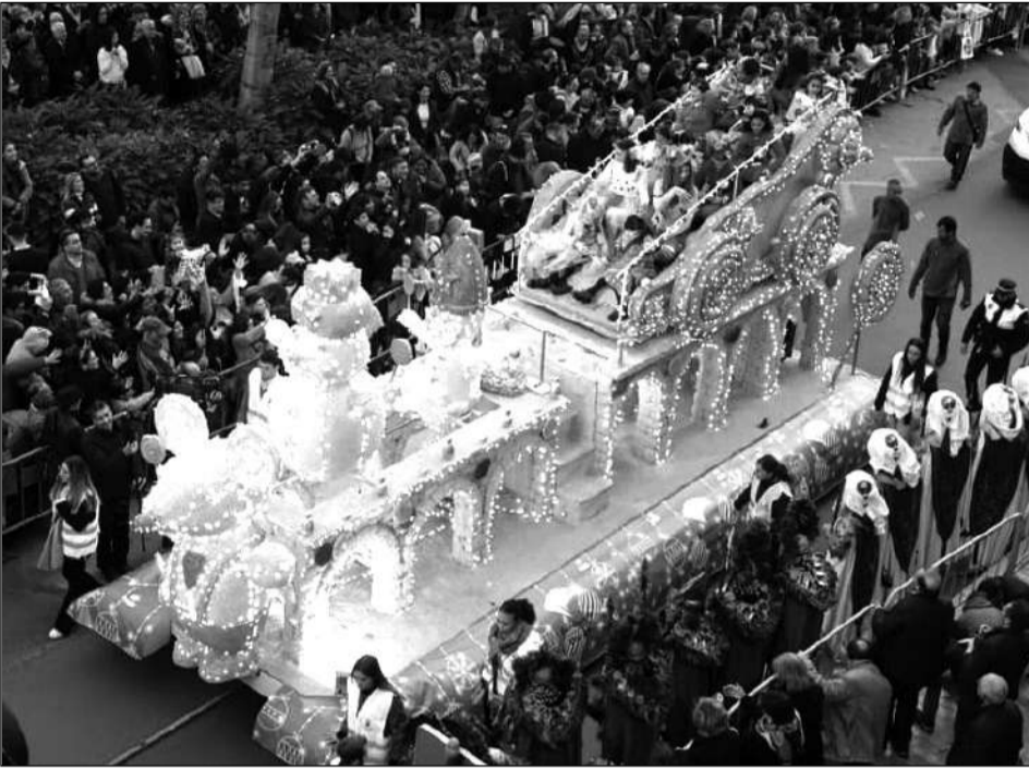
Una de las nuevas carrozas que componían el cortejo.