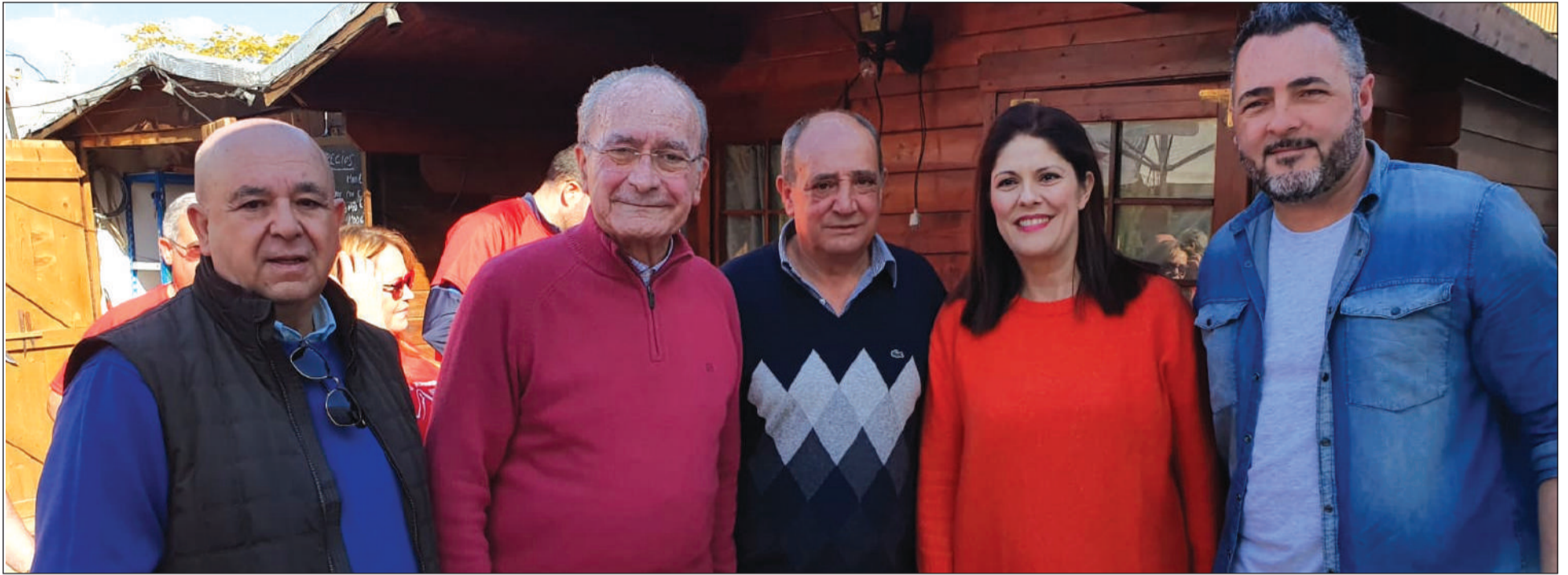
Asistentes a la tradicional actividad de las Migas Solidarias que cada año organiza la Peña Colonia Santa Inés.