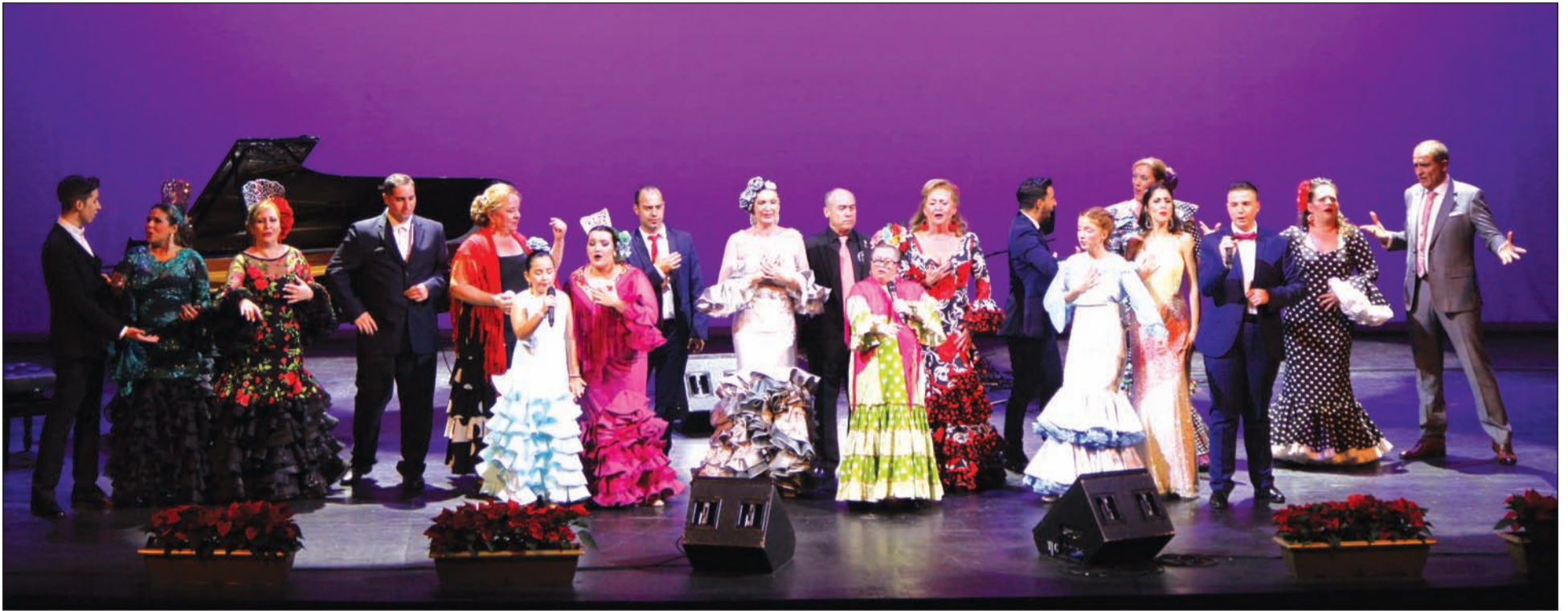
Alumnos de la Escuela, en la gala Málaga Cantaora del pasado mes de diciembre.