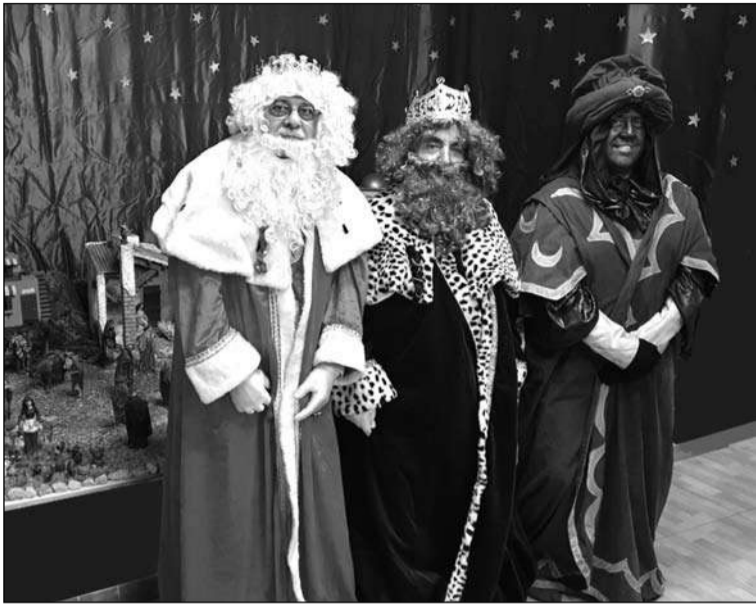
Los Reyes Magos, ante el Belén de la entidad.