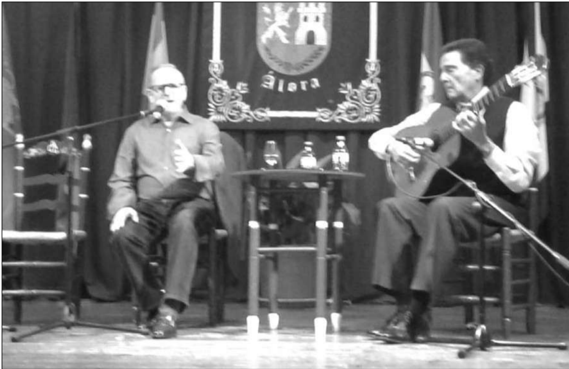
Un instante del espectáculo.