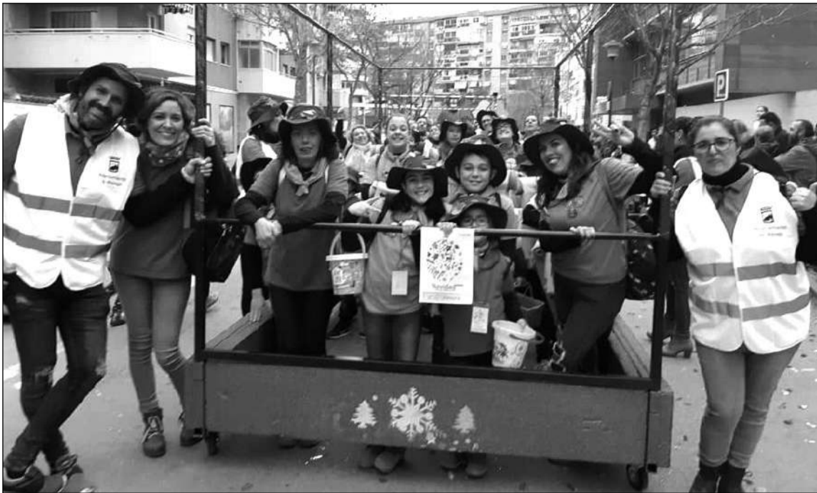
Participantes en la cabalgata de Cruz de Humilladero.