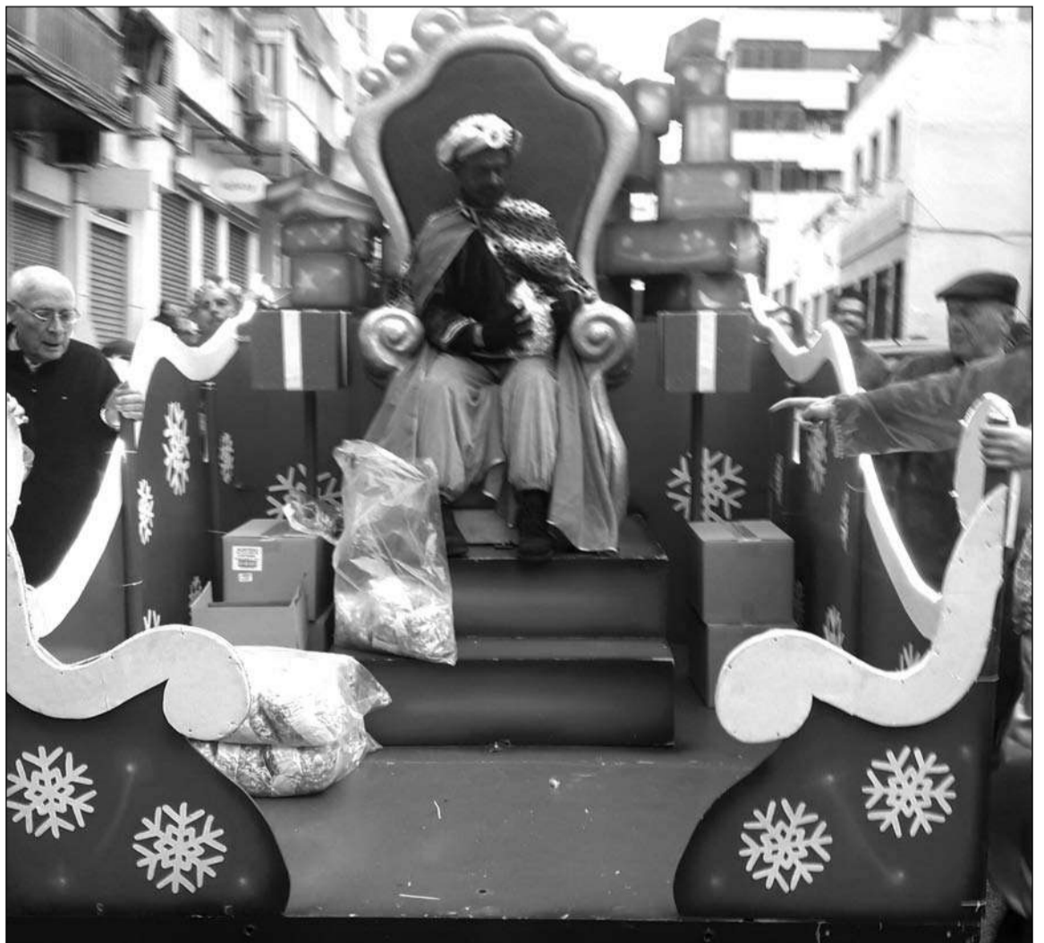
Cabalgata or las calles del Distrito.