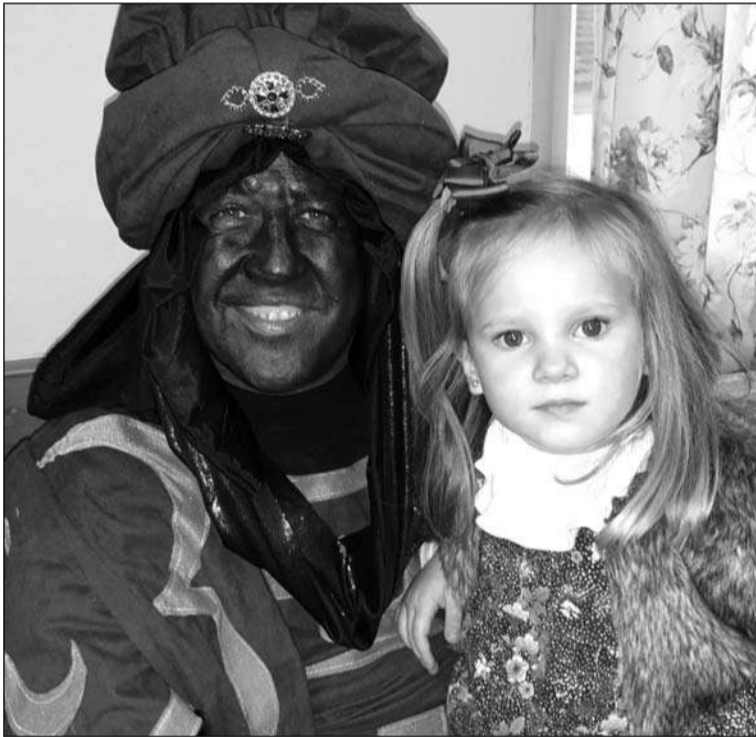
Ilusión de una niña con Baltasar.