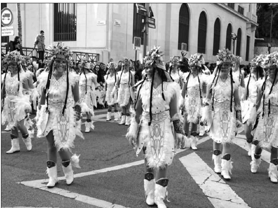
Uno de los pasacalles que formó parte del Desfile de la Ilusión.