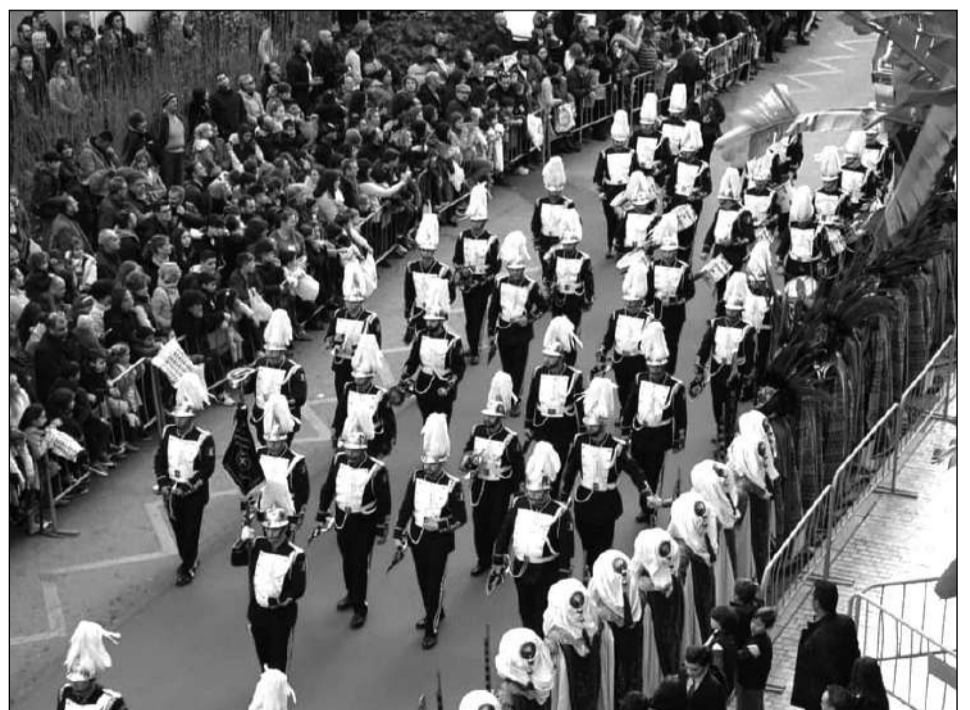
La Banda del Real Cuerpo de Bomberos no faltó a esta cita.