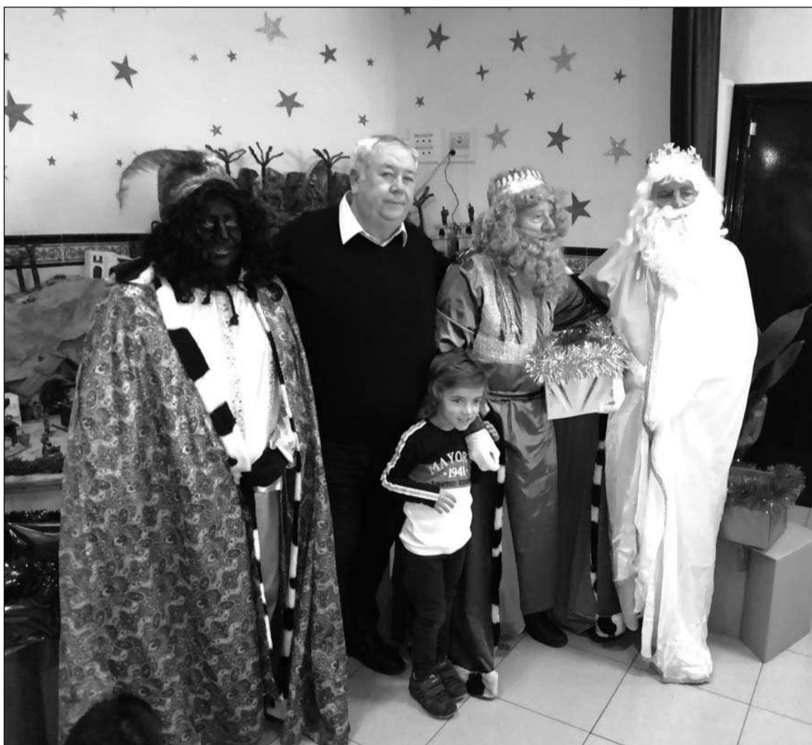
Los Reyes Magos, con el presidente y un niño de la entidad.