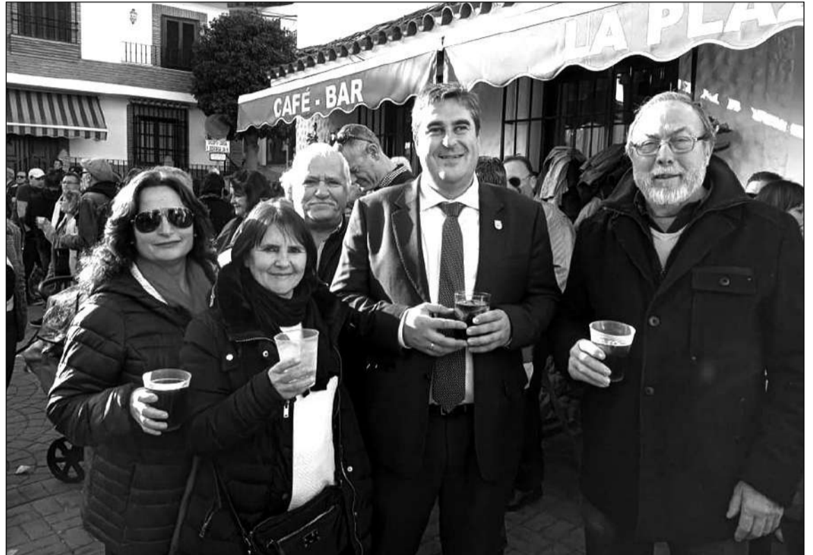
Imágenes de la presencia de la Peña Perchelera en la Fiesta de San Hilario de Comares, donde fueron atendidos por su alcalde.