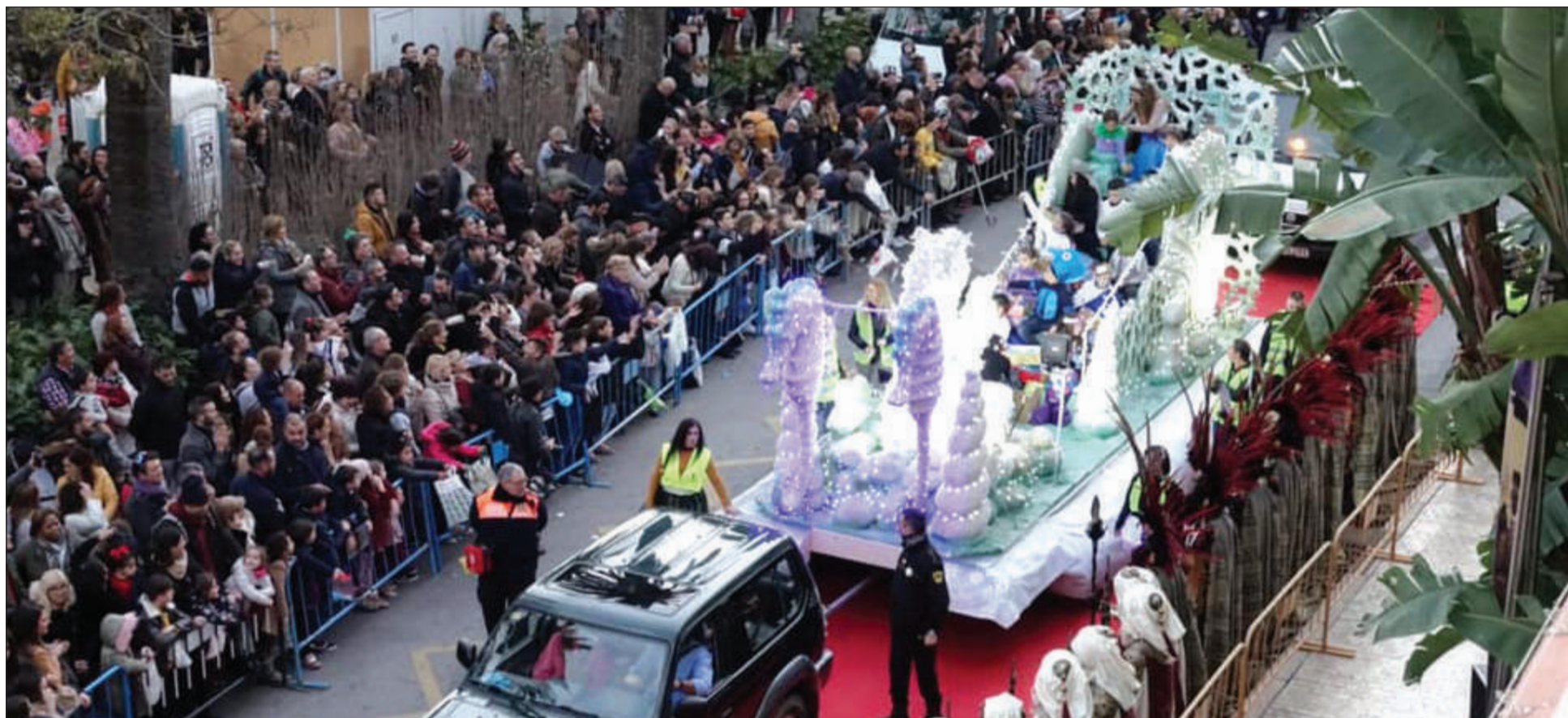
Carroza de la Federación Malagueña de Peñas, a la salida del cortejo.