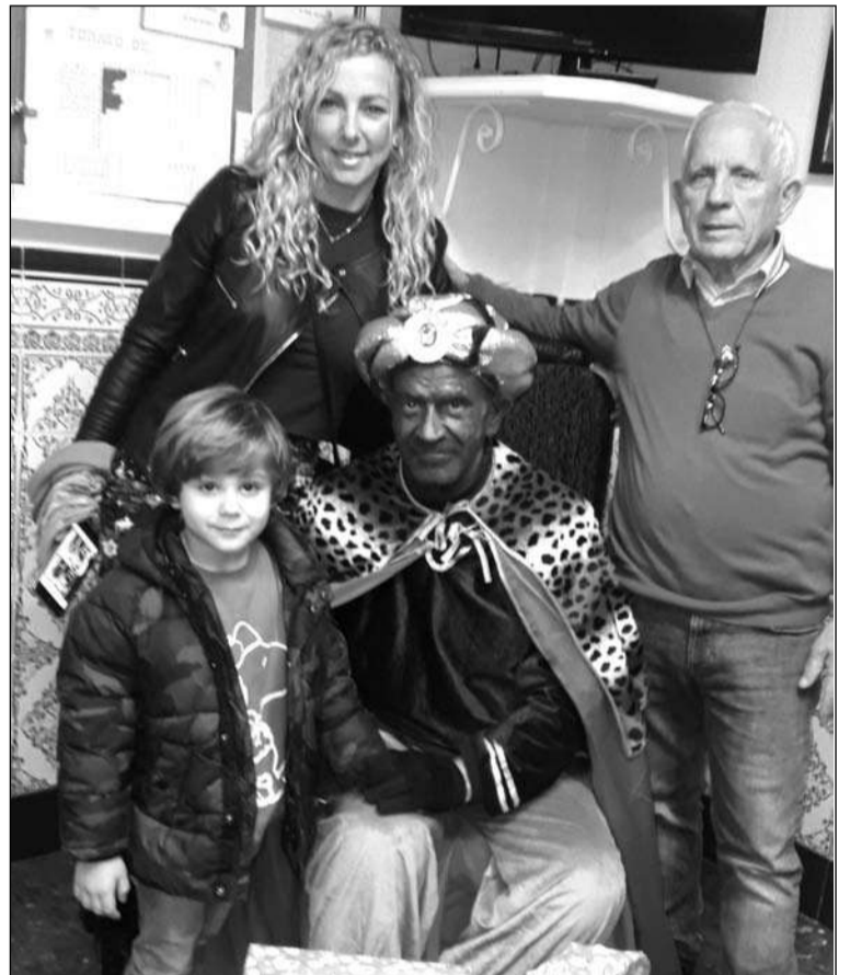
Distintas generaciones alrededor del Rey Baltasar.