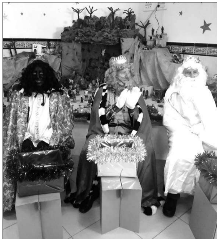
Los Magos de Oriente, ante el Belén.