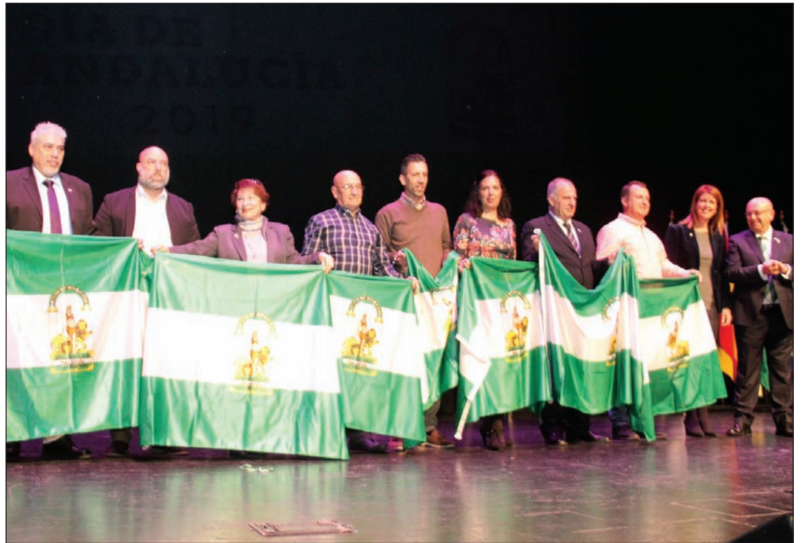
Entrega de banderas de Andalucía el 28 de febrero de 2019.