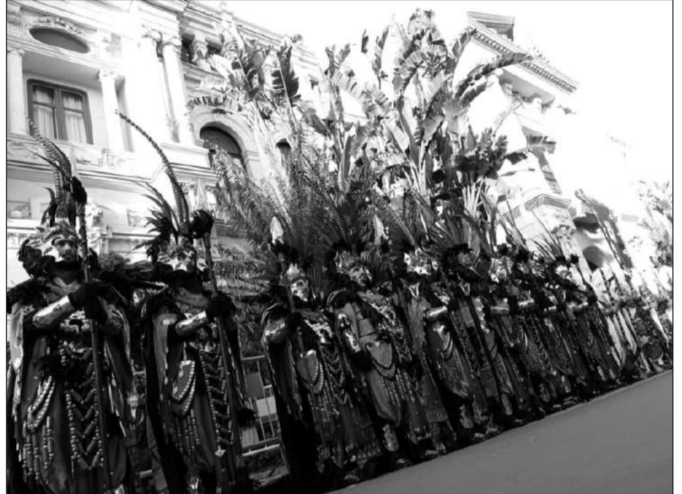
Guardia de Sus Majestades, preparada para comenzar el cortejo.