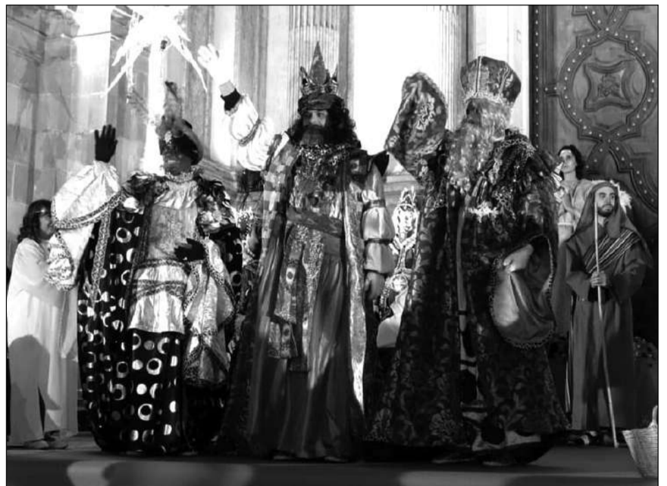
Los Reyes Magos se despiden de los malagueños tras la oración al Niño Jesús.