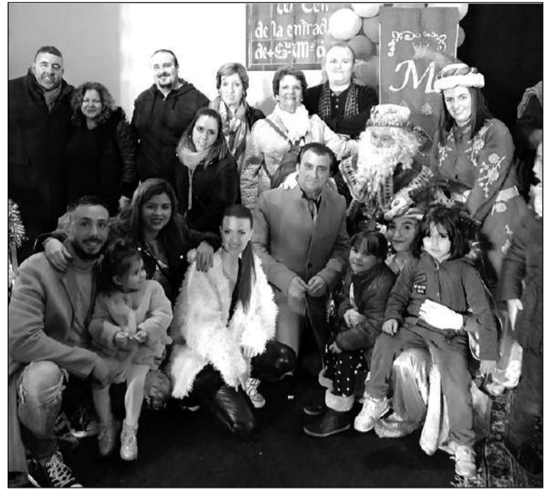
Socios con el Rey Melchor.

Además, se ha completado una campaña solidaria 'Yo colaboro, ¿y tú?', que ha contado con una importante participación para contribuir a que familias del entorno haya disfrutado de unas mejores fiestas navideñas.