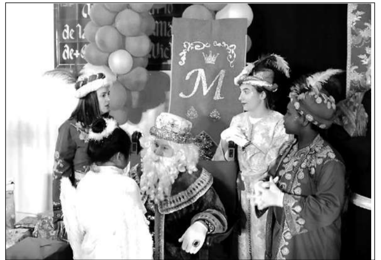
Sus Majestades atendieron a los pequeños en el exterior del templo.

◆ Federación Malagueña de Peñas, Centros Culturales y Casas Regionales 'La Alcazaba'