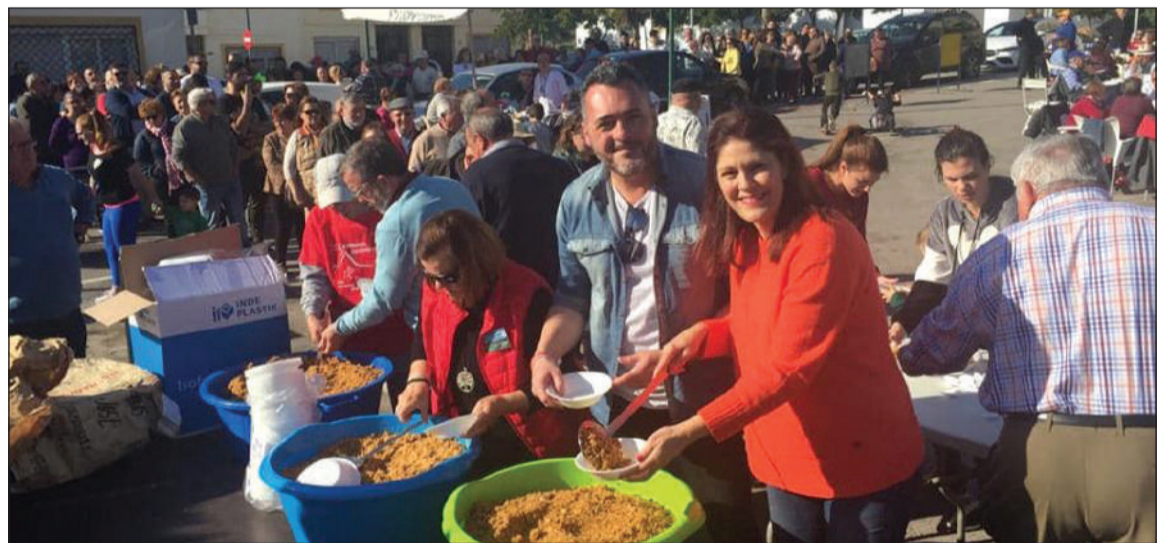
Reparto de las Migas entre los asistentes.