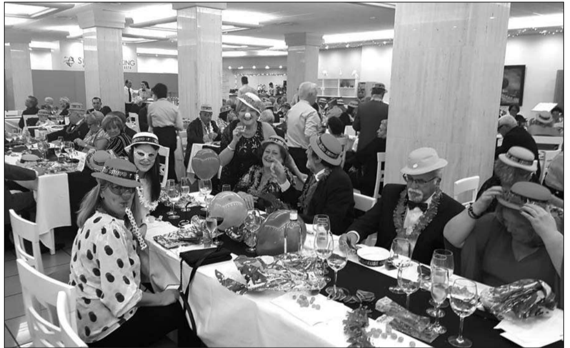
Socios comparten la entrada del año nuevo.

tar el Belén instalado en la primera planta de sus instalaciones y también para recibir innumerables cartas de hijos y nietos de asociados que a través de ellas hacen sus peticiones de juguetes y regalos. Con la bondad y complacencia que caracterizan a estos regios personajes, repartieron juguetes y chuches a todos los niños y niñas que se acercaron al saludarlos, ya en espera de la Noche Mágica del 5 de enero.