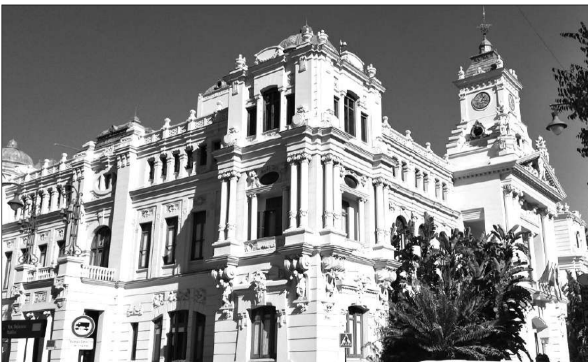
Edificio sede del Ayuntamiento de Málaga.

La Peña El Boquerón, entidad perteneciente a la Federación Malagueña de Peñas, Centros Culturales y Casas Regionales 'La Alcazaba', iniciaba las actividades de este año 2020 el 4 de enero, cuando se reunían las mujeres; mientras que el 14 de ese mismo mes arrancaba un nuevo torneo de chinchón, dominó, parchís y rana.