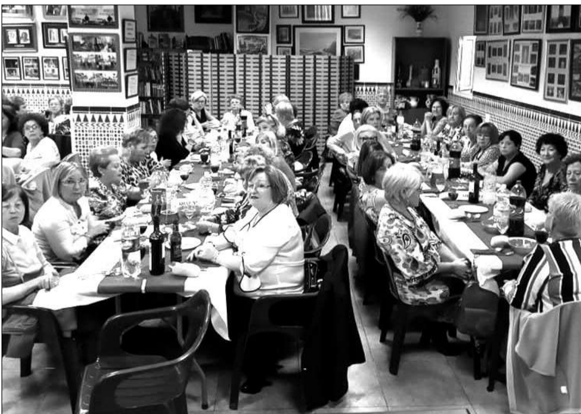
Imagen de archivo de un Encuentro de Mujeres celebrado en 2019.

◆ Federación Malagueña de Peñas, Centros Culturales y Casas Regionales 'La Alcazaba'