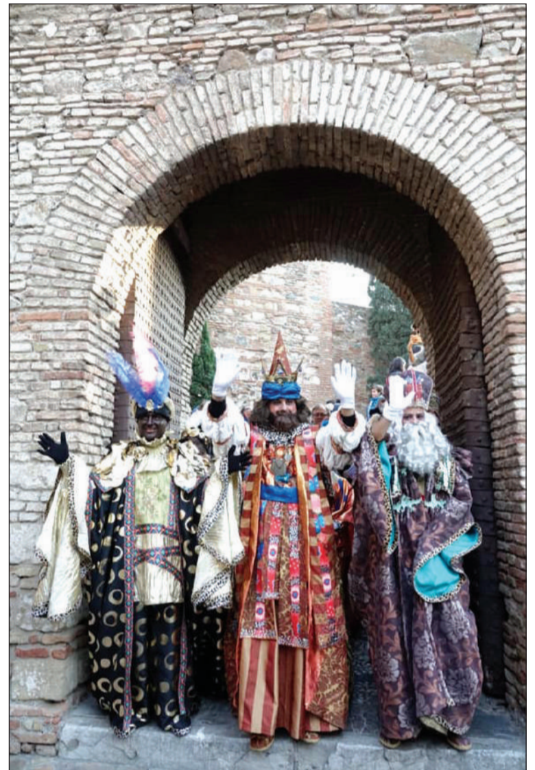
Los Reyes, a su salida de la Alcazaba.

Además de estas 10 carrozas encargadas por el Área de Fiestas del Ayuntamiento, había otras cuatro aportadas por diferentes entidades (Fundación Andrés Olivares, María Auxiliadora, La Canasta y Club de los Leones Málaga).