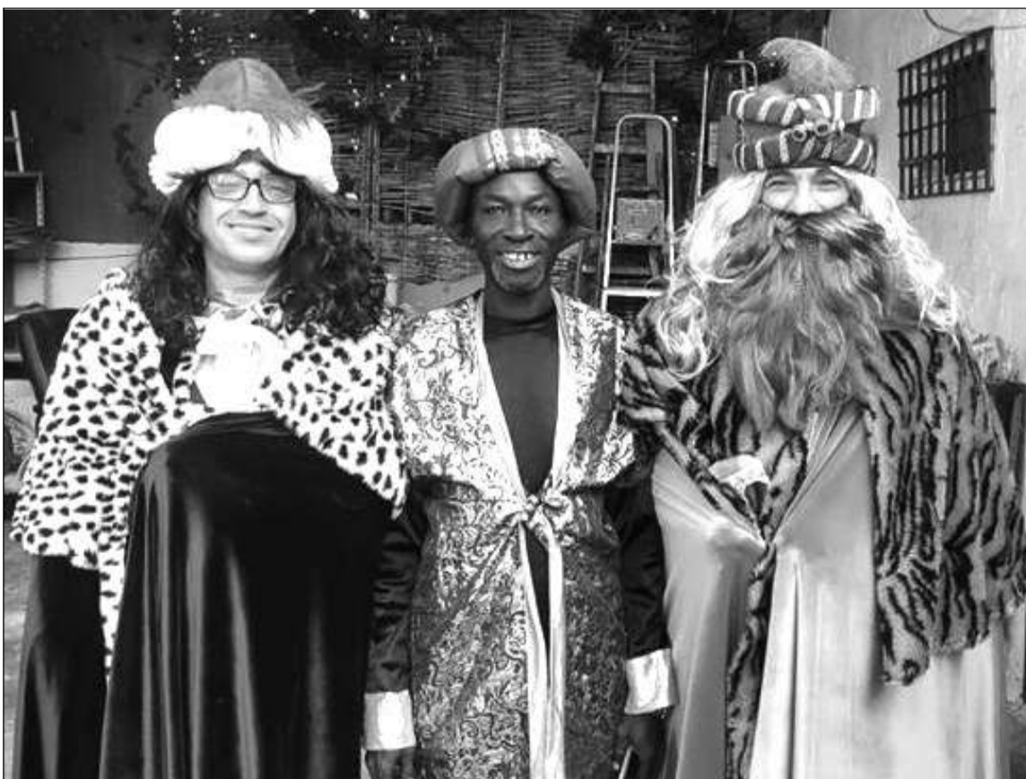
Los Reyes Magos de la Peña Los Corazones.