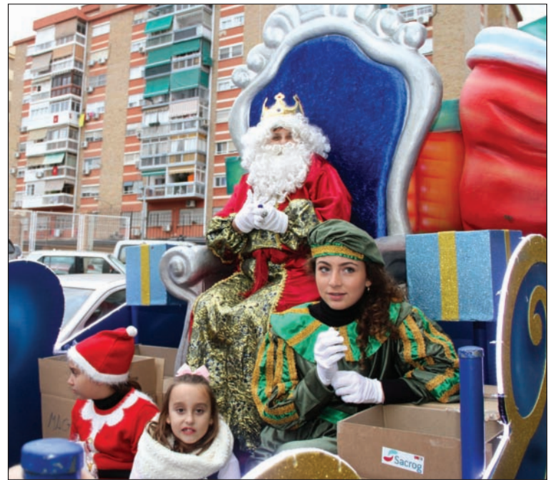
El Rey Melchor en la cabalgata de Bailén-Miraflores.