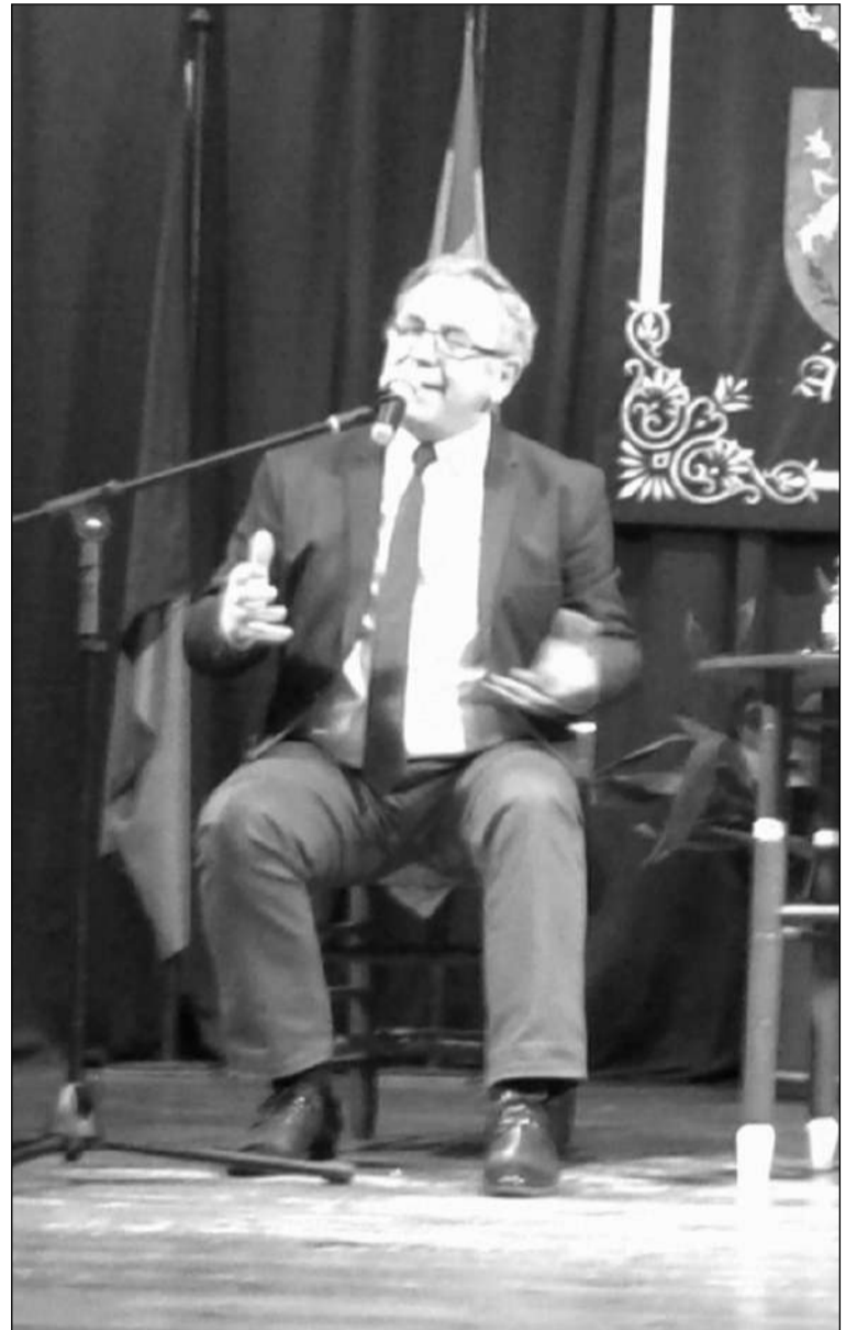
Primera Pringá Flamenca de 2020.