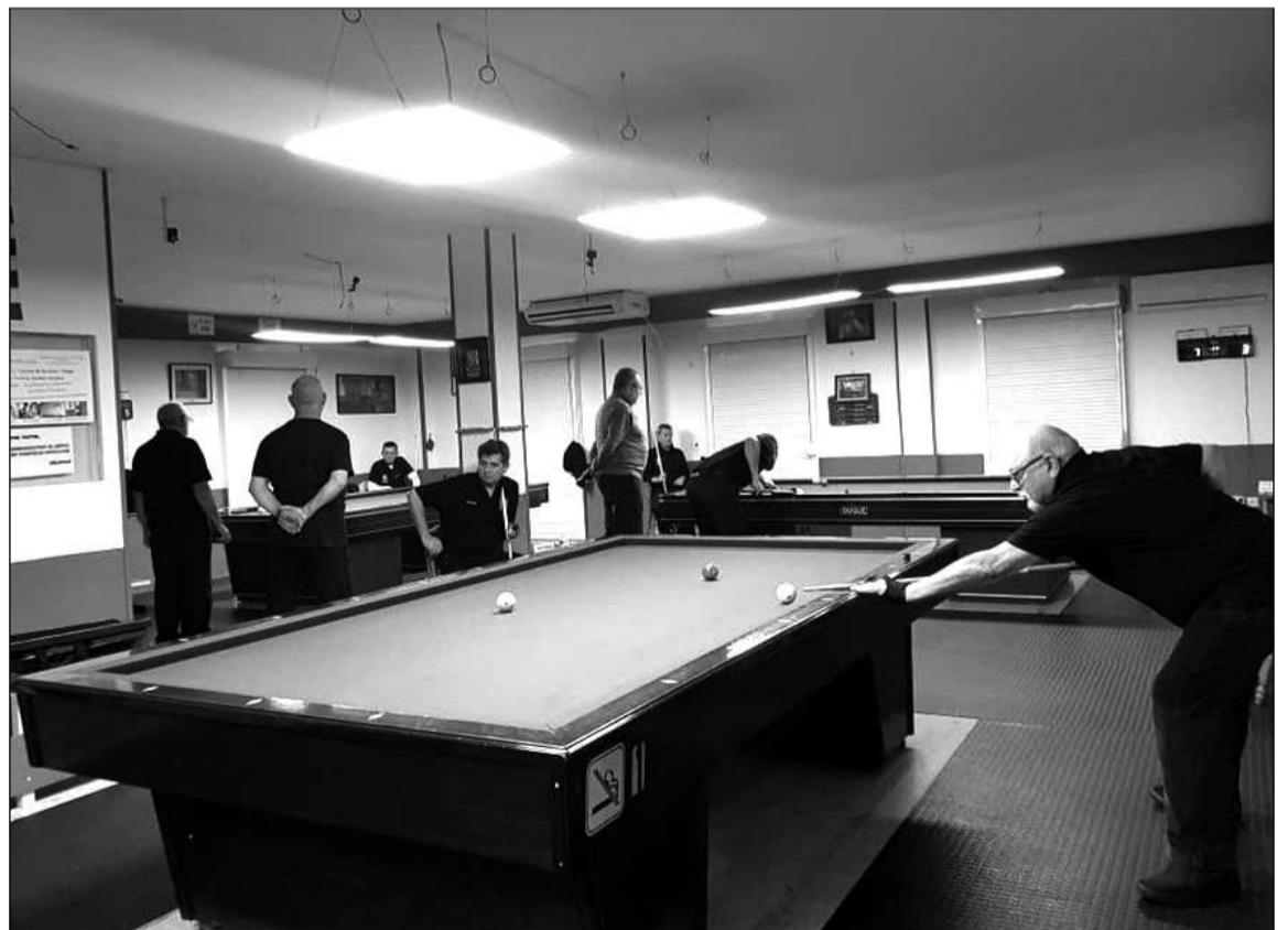
Disputa de una jornada ligera de Billar en la sede de la entidad.