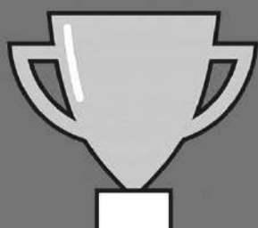
Cartel de la actividad.

menú. 5 EUROS INSCRIPCIÓN 1 EURO. LLAMAR AL 636877483