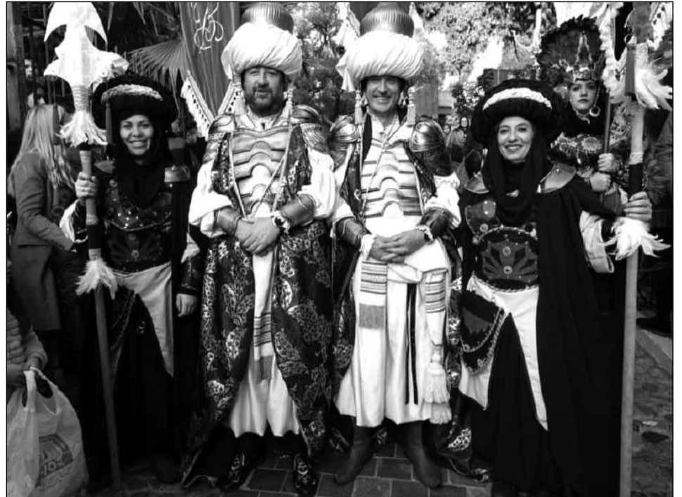
Integrantes de la comitiva de los Magos de Oriente.