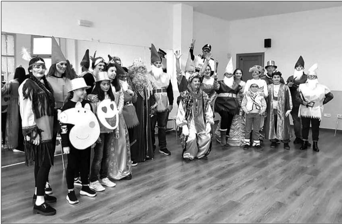
Participantes en la cabalgata.