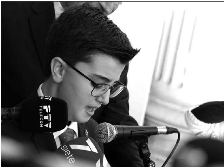
Lectura de una carta en nombre de todos los niños malagueños.