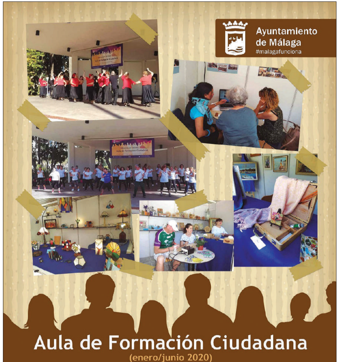
Detalle del cartel de la actividad.