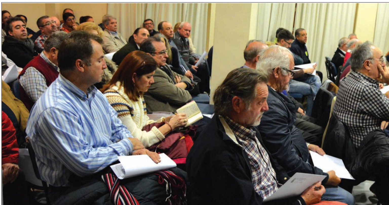
Imagen de archivo de los asistentes a una asamblea general en la sede de la Federación Malagueña de Peñas.

Junto al estado de cuentas, esta Asamblea General Ordinaria incluirá, tal y como es habitual cada año, entre sus puntos del orden del día la lectura y aprobación del acta de la sesión anterior, la memoria de actividades realizadas en 2019, el proyecto de actividades para 2020, o el proyecto económico para el ejercicio que acabamos de comenzar.