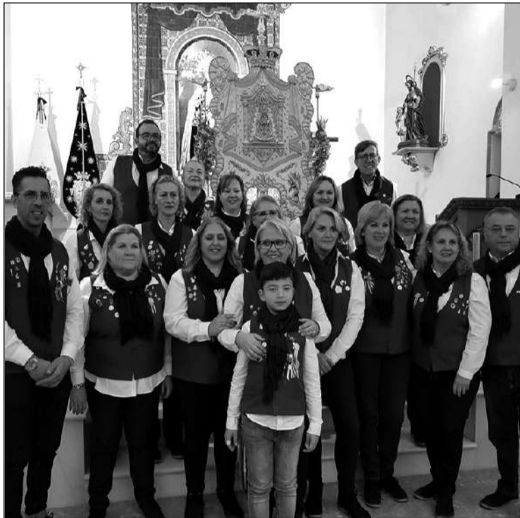
Ante el Simpecado de la Hermandad del Rocío.

Entre los numerosos momentos especiales que se han vivido también destaca la llegada de los Reyes Magos a su sede, uno de los momentos más especiales para todos los socios y que se revivía con la presencia de Melchor y Gaspar.