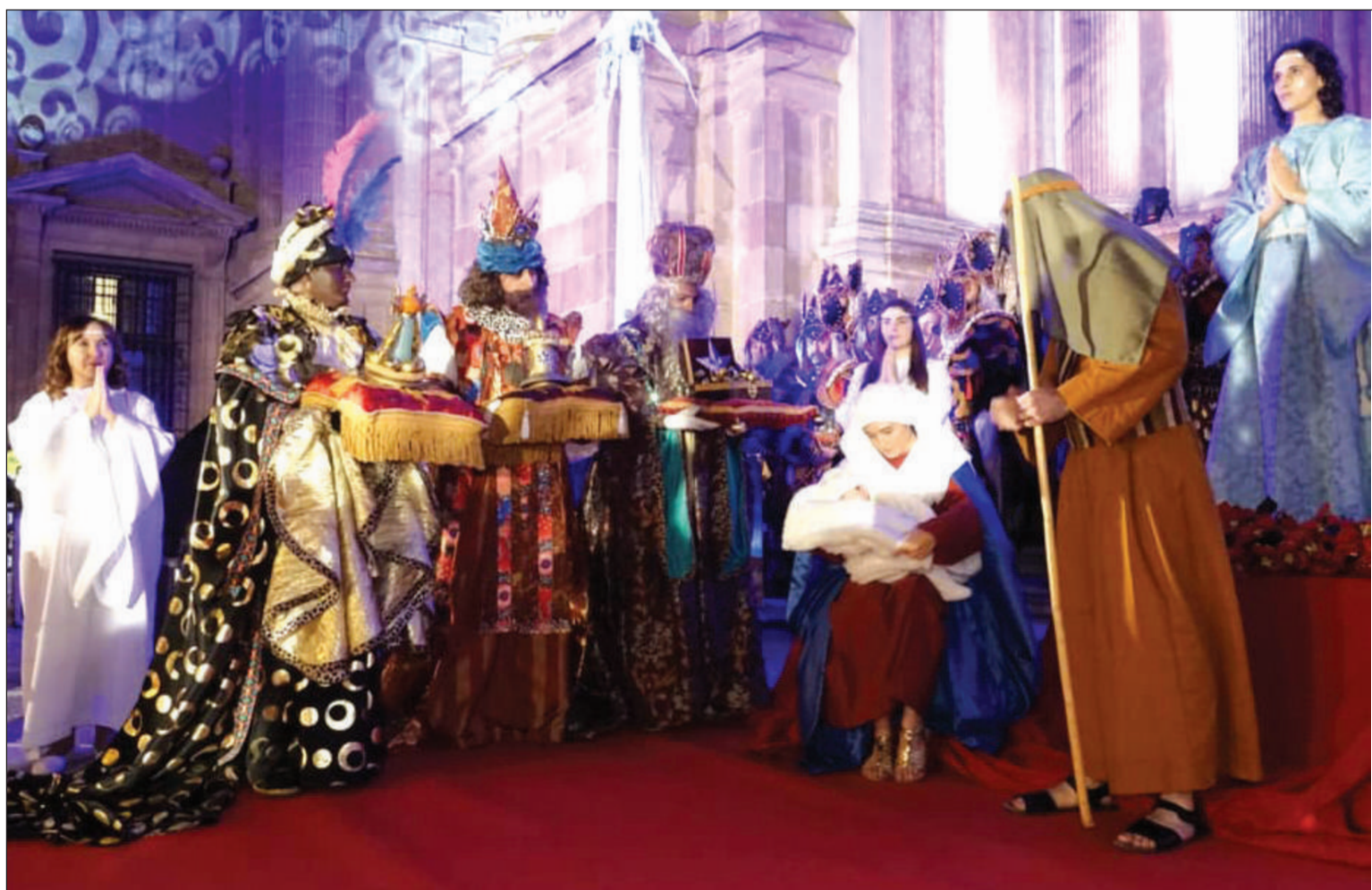
Adoración de los Reyes Magos en la fachada de la Catedral.