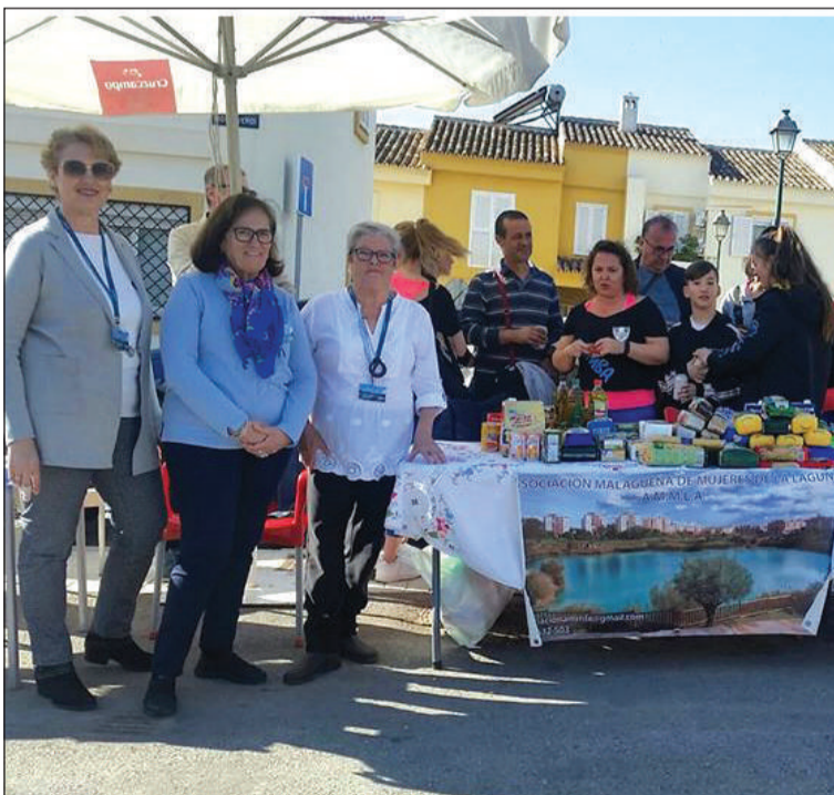
Voluntarias de la Asociación La Laguna.