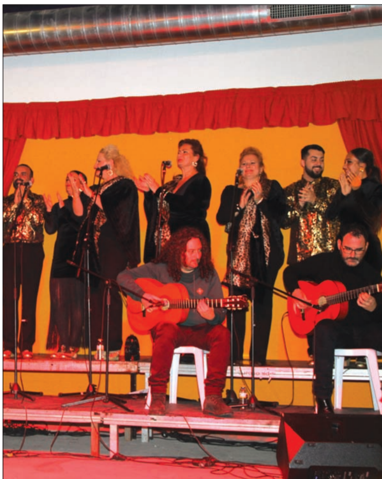
Una de las actuaciones incluidas en la Zambomba.