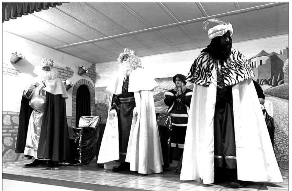
Los Reyes Magos en la sede de la Peña La Biznaga.

También dejaron regalos entre los asistentes a esta actividad con la que se abría el programa de actos de la Peña La Biznaga para este recién estrenado año 2020.