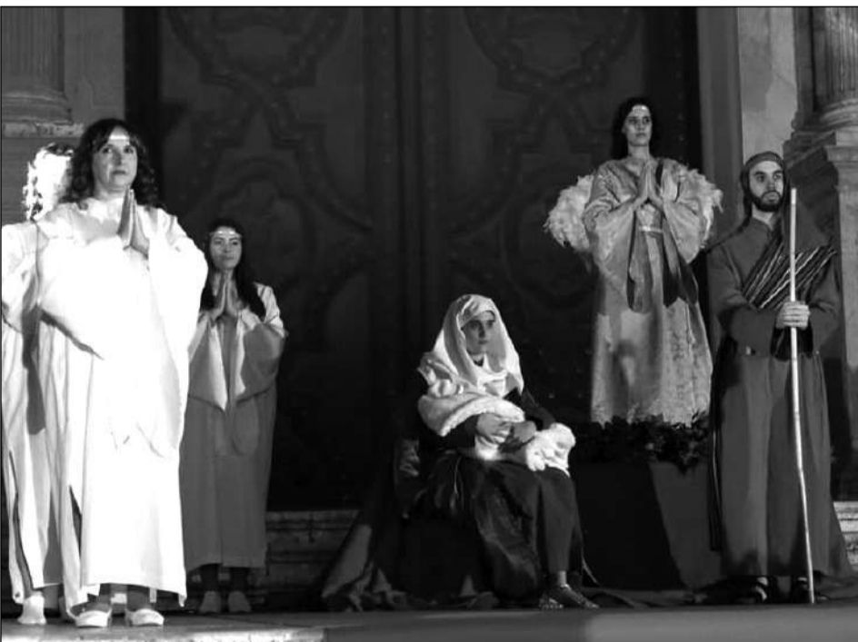
Belén viviente en las escalinatas de la Catedral.