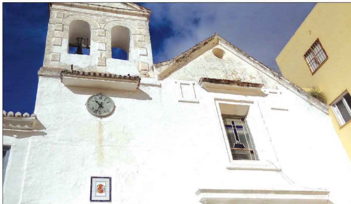
Fachada del histórico edificio del Asilo de los Ángeles.