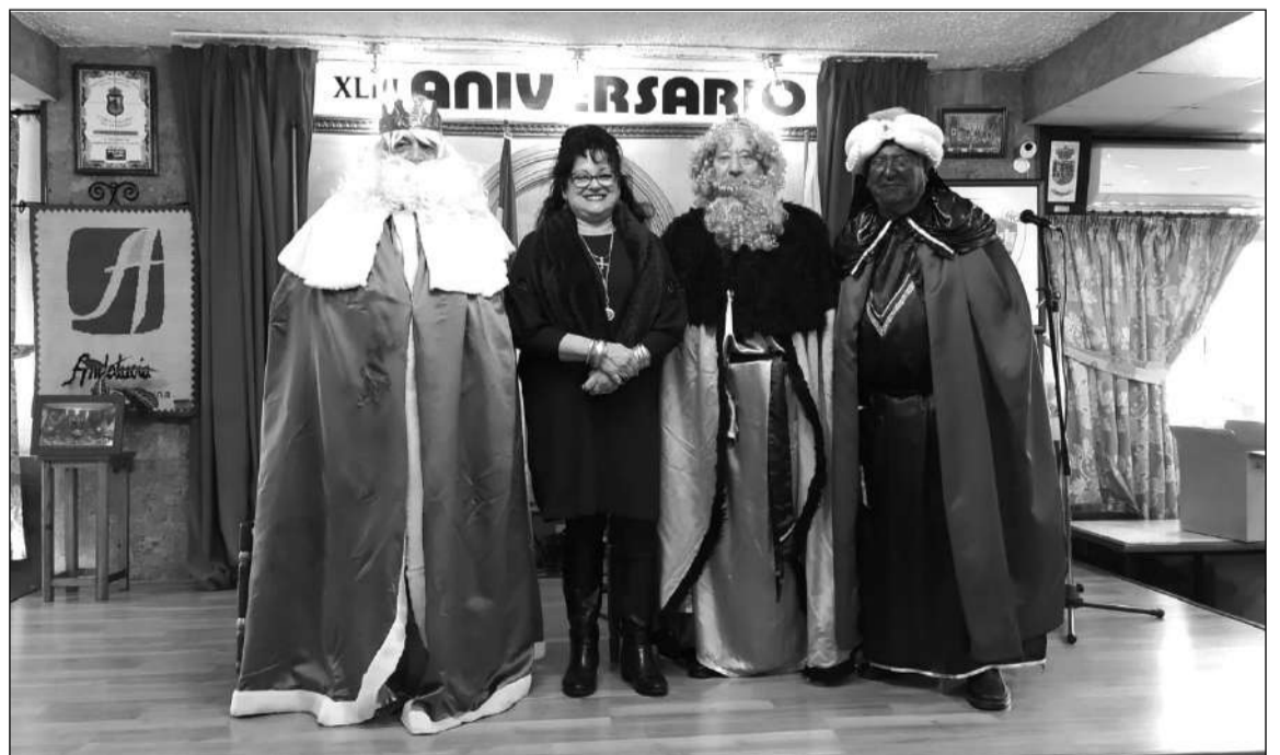
Los Reyes Magos, con la presidenta.