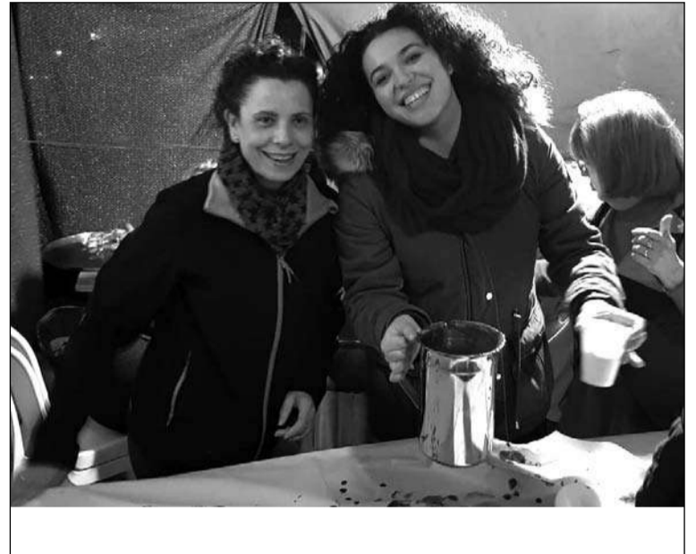
Reparto de chocolate.

En el Jardín de Santa Ana se repartía por parte de la entidad chocolate y dulces, colaborando de este modo en una actividad destinada a los niños, y en la que los mayores se lo pasaron como enanos.