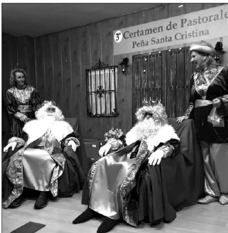
Los Reyes con sus pajes.