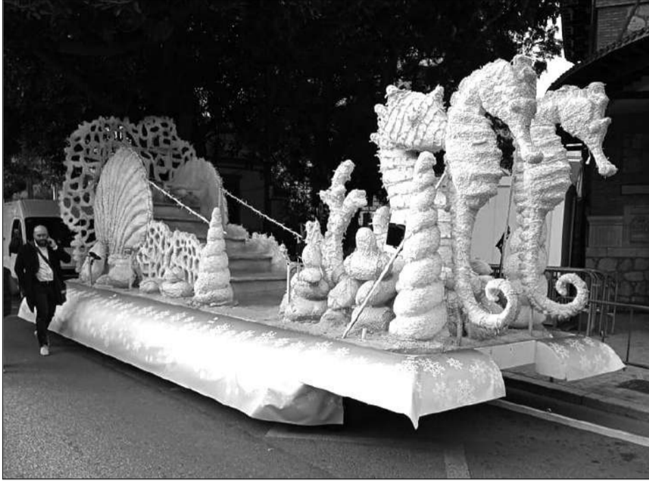
La carroza de la Federación de Peñas, lista para comenzar la cabalgata.