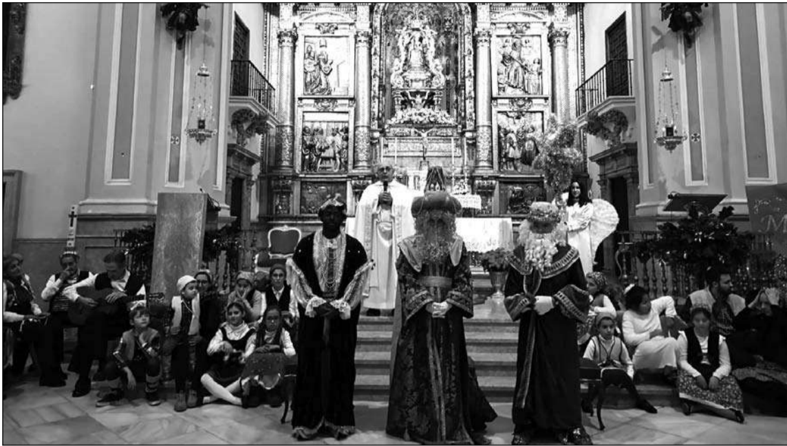
Los Reyes Magos, en el altar mayor del Santuario.