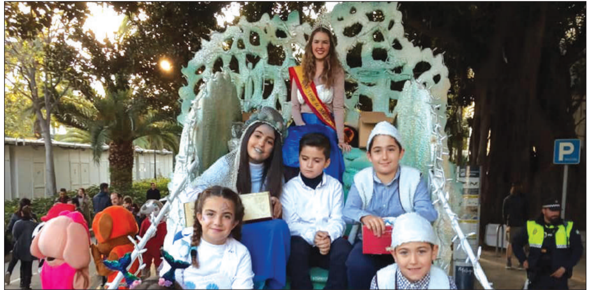
Carroza de la Federación.