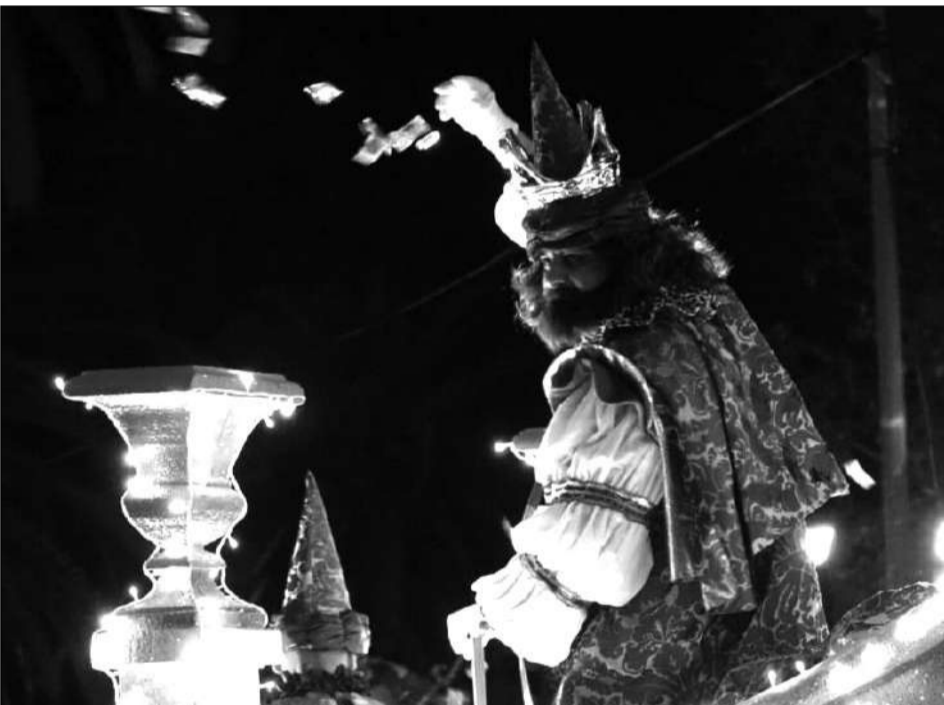
El Rey Gaspar lanza caramelos a los niños.