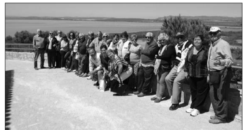
Senderistas, delante de la Laguna de Fuente de Piedra.

Mientras tanto el otro grupo podía disfrutar de una Romería en honor de San Benito, patrón de la localidad, que el pseudoeste, dejando la gran laguna pretende recuperar como tradición. Posteriormente se desplazó a la Laguna de Fuente de Piedra. La belleza armoniosa del lugar unido a la excelencia climatológica, hicieron que la visita fuera sobresaliente. Una vez unidos los dos grupos en la plaza central del pueblo, se dispusieron a dar buena cuenta de un copioso almuerzo en la sierra la mayor parte en ascenso por cañana.