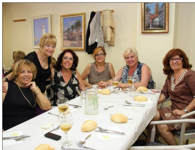
Un grupo de peñistas.