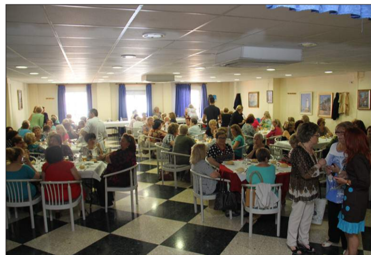
Aspecto que presentaba el salón.