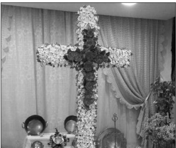
Peña Los Ángeles.