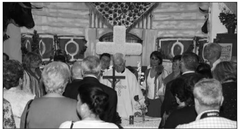
Un instante de la Eucaristía.