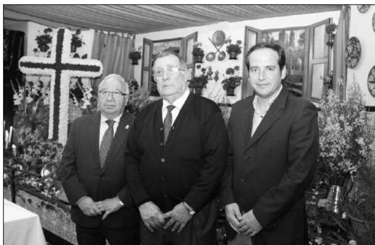
El presidente de la Federación, el de la peña y el director de distrito.