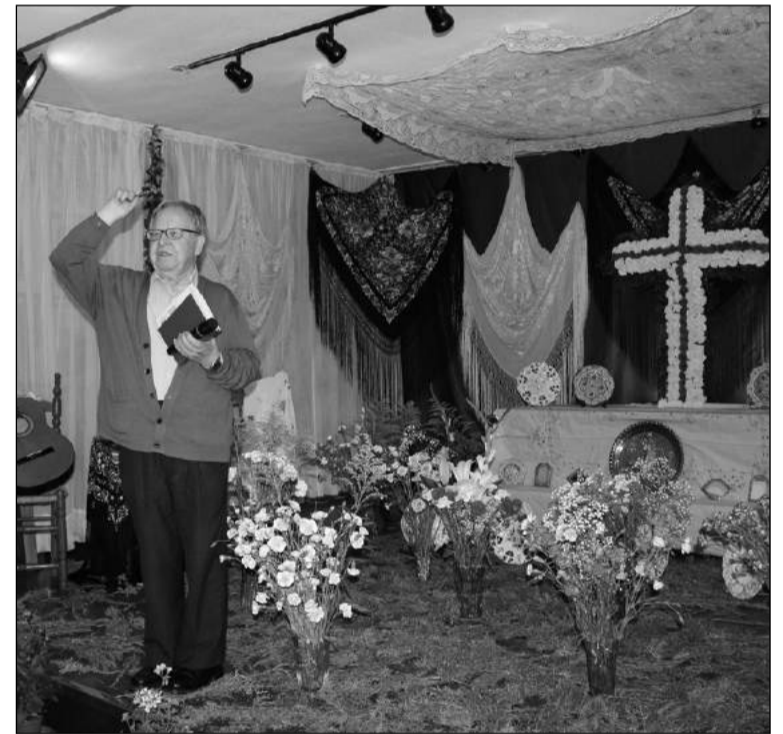
Bendición de la Cruz.

La fiesta se prolongó durante toda la tarde en otro inolvidable jornada en la Casa de Melilla.