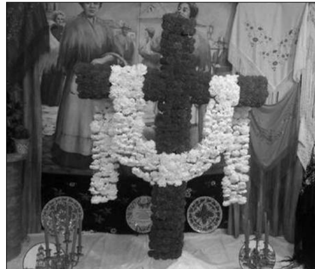
Peña Recreativa Trinitaria.