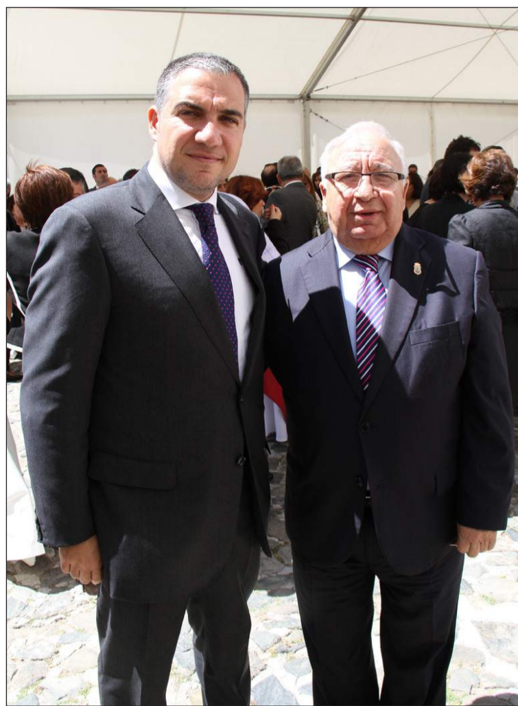
El presidente de la Diputación, junto al presidente de la Federación de Peñas.

En la década de 1960 se entregaron las primeras Medallas de Oro de la provincia y fueron premiados, entre otros, la Agrupación de Cofradías de la Semana Santa de Málaga o el entonces ministro de Obras Públicas, Federico Silva.