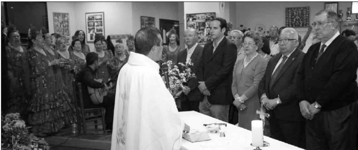
Celebración de la Misa en la entidad.