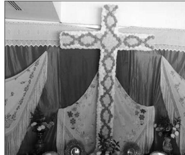
Asociación de Vecinos Zona Europa.