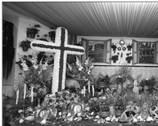
Peña Cruz de Mayo.

Por cierre de edición, en este número no se incluyen las Cruces de Mayo visitadas por el jurado el martes día 6.