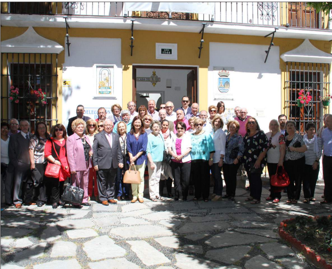
Peñistas frente al Ayuntamiento de Estepona con los representantes municipales.