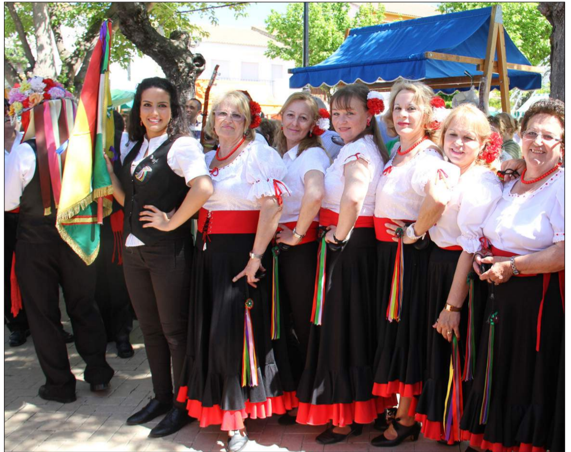
Componentes de la Panda de Verdiales de la Peña La Paz.

También el diputado de Turismo quiso reconocer la labor de la Federación Malagueña de Peñas 'La Alcazaba' "por llevar este colectivo más allá de nuestra capital".