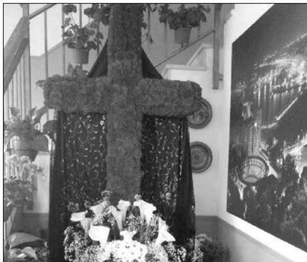
Peña Santa Cristina.