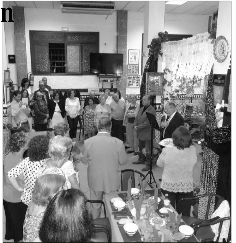
Inauguración de la Cruz de Mayo.