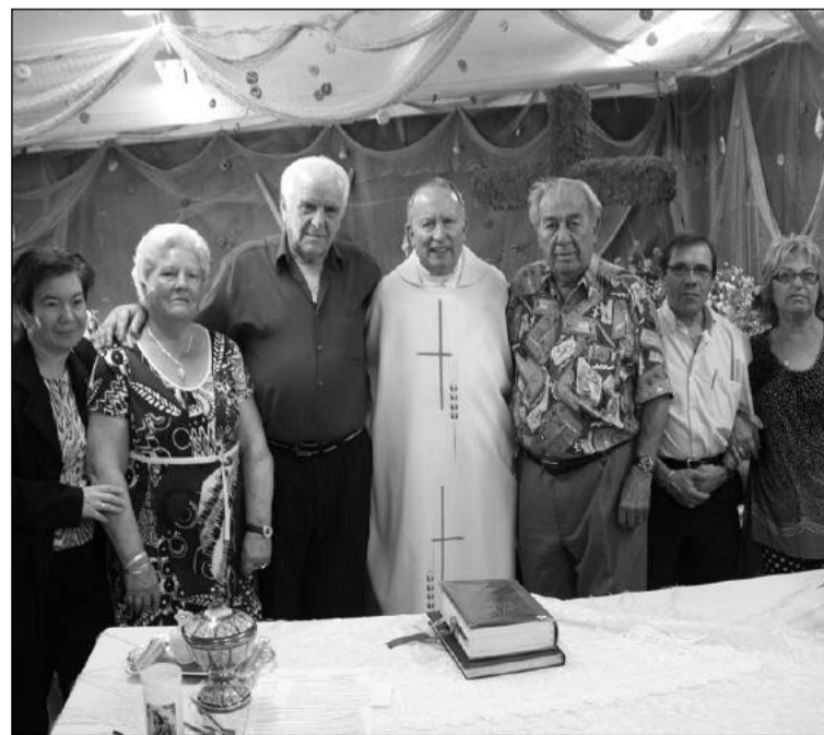
Socios de la Peña, junto al sacerdote.