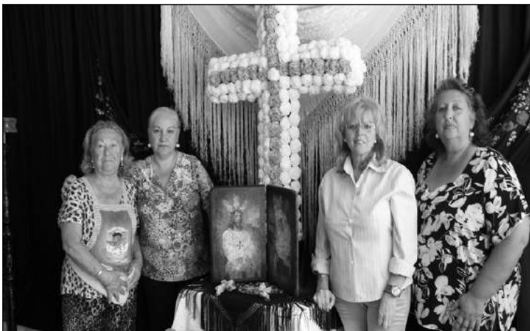
Mujeres peñistas junto a la Cruz de Mayo.

La Cruz de Mayo presidía este acto, en el que además se daba la circunstancia de que era la primera vez que se instalaba la cruz en la nueva sede social con la que desde hace unos meses cuenta esta entidad federada,