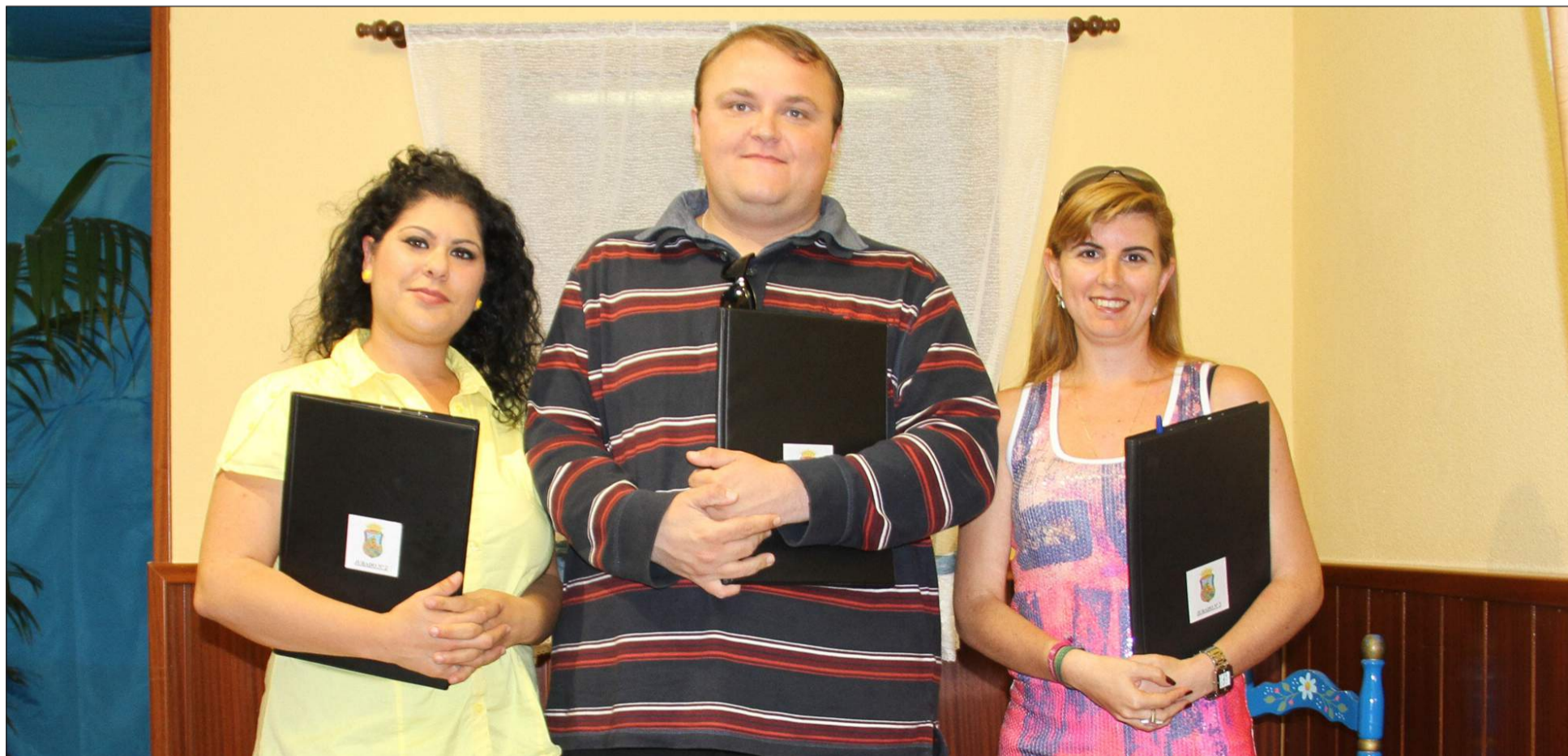
Miembros del jurado durante la visita a las entidades participantes.