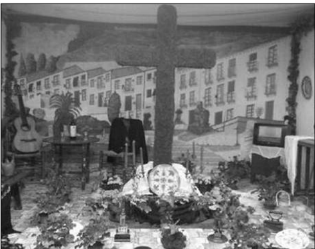
Peña Cortijo de Torre.