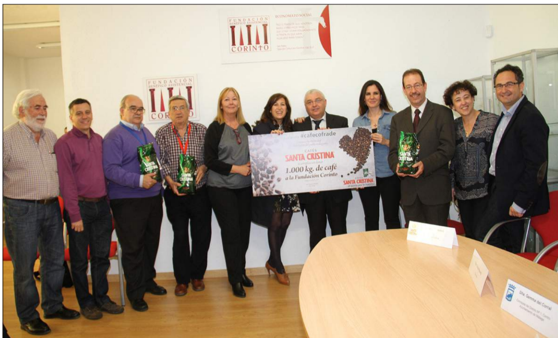
Entrega simbólica de mil kilos de café.