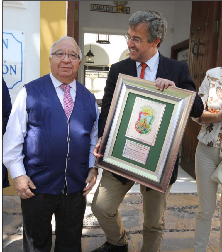
Entrega de un recuerdo al alcalde.