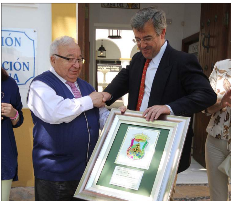
Entrega de un recuerdo al alcalde de Estepona.