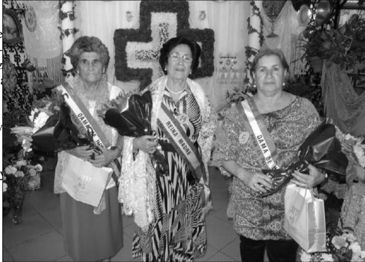
La Reina Madre y sus damas de honor.

A continuación los asistentes pudieron degustar una extraordinaria cena preparada por las mujeres del Club Femenino de la Peña.