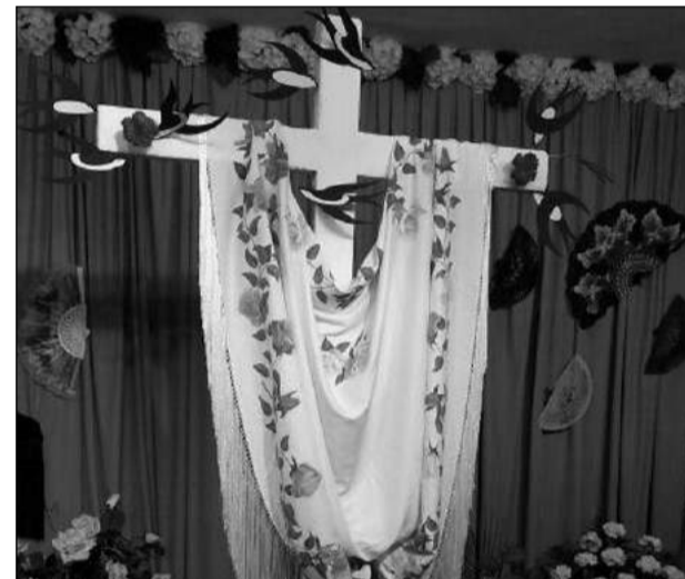
Peña El Boquerón.