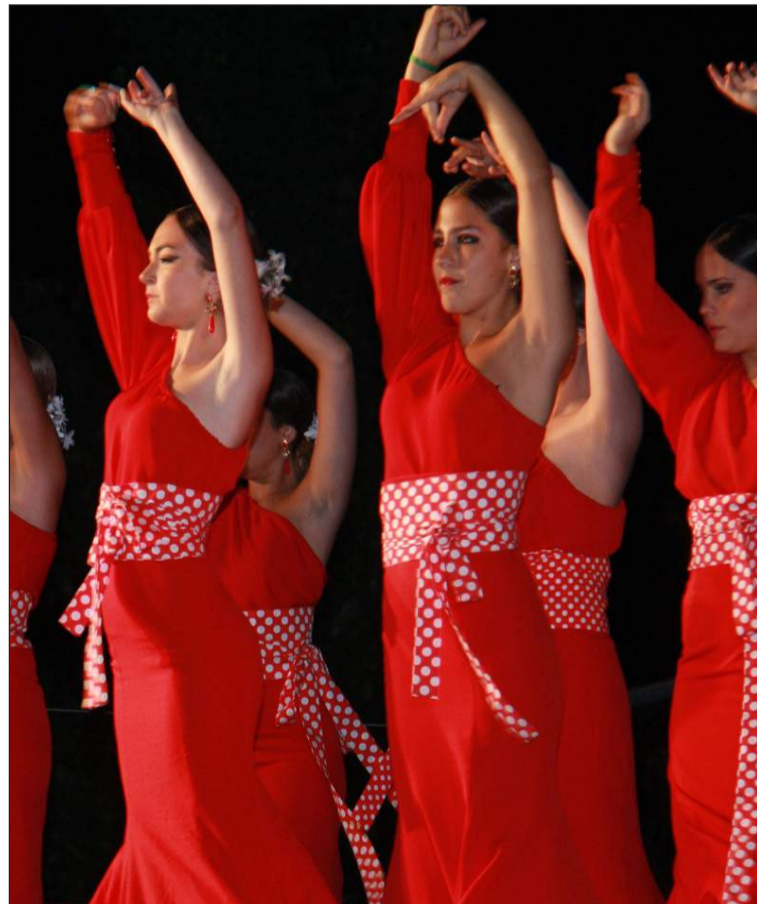
Los grupos de baile acompañan a las composiciones.

Entidades colaboradoras con esta publicación: