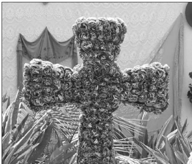
Asociación María del Mar Sillero.