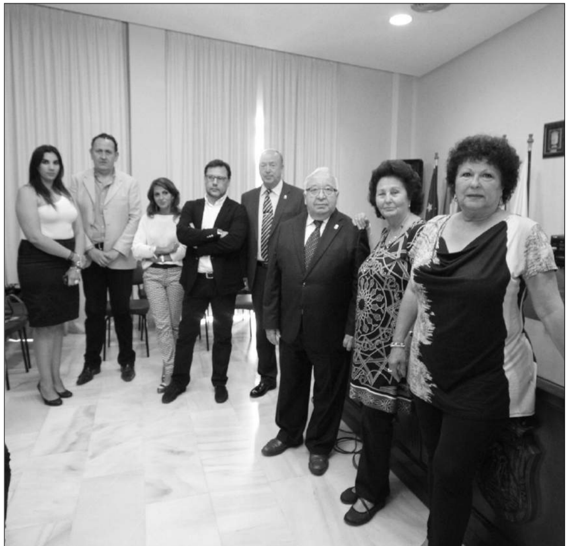
Apertura del Curso 2014 de la Escuela de Copla en el salón de actos de la Federación de Peñas.