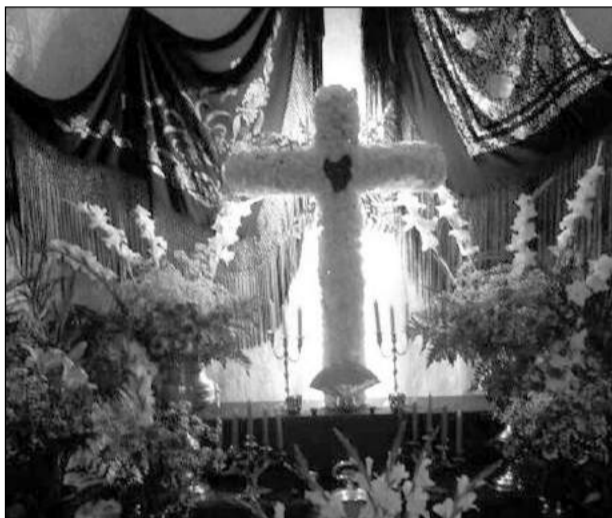
Peña Los Rosales.