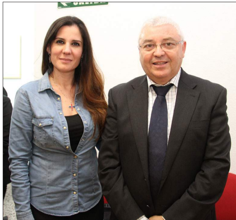
La popular cantante, con el director de Cafés Santa Cristina.

La Fundación Corinto, integrada por hermandades de la ciudad, gestiona este economato social para aquellas personas o familias que estén pasando por una situación económica difícil.