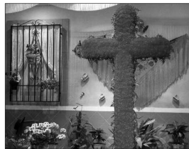
Casa de Álora Gibralfaro.