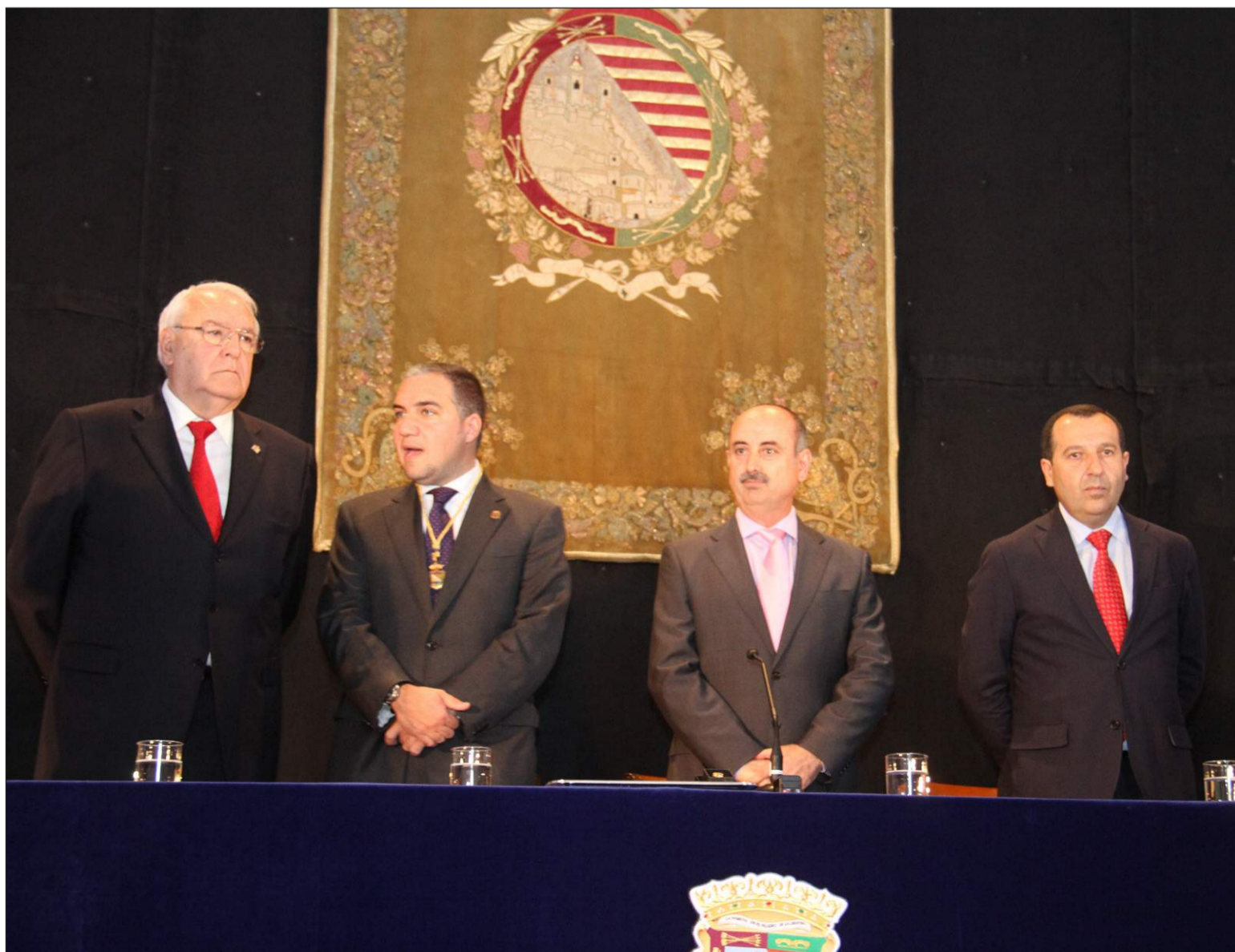
Autoridades que presidieron el acto institucional.