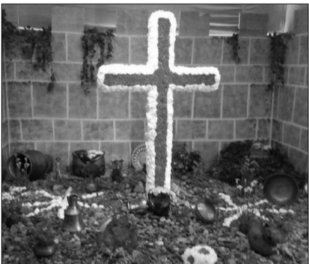
Peña Finca La Palma.