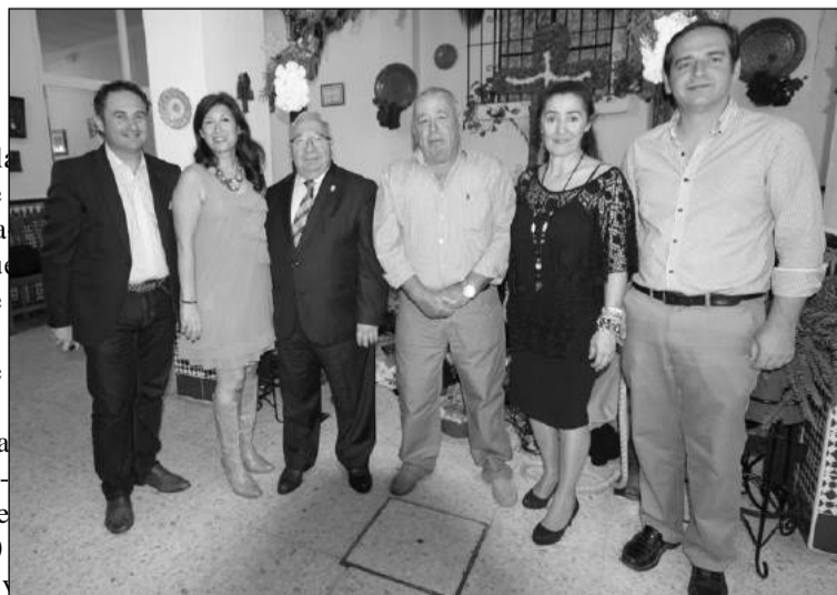
Autoridades municipales y el presidente de la Federación, en la inauguración.

La Asociación de Vecinos de Ciudad Jardín (AVECIJA) celebraba el pasado 1 de mayo la inauguración de la Cruz de mayo, con un acto que se iniciaba a las 13:30 horas, y que contó con una degustación de aperitivos. Durante el pasado fin de semana, concretamente para el 4 de mayo, estaba prevista una excursión a los Patios de Córdoba; mientras que la Cruz se clausurará el próximo día 10 con la actuación de un coro y grupo de baile.