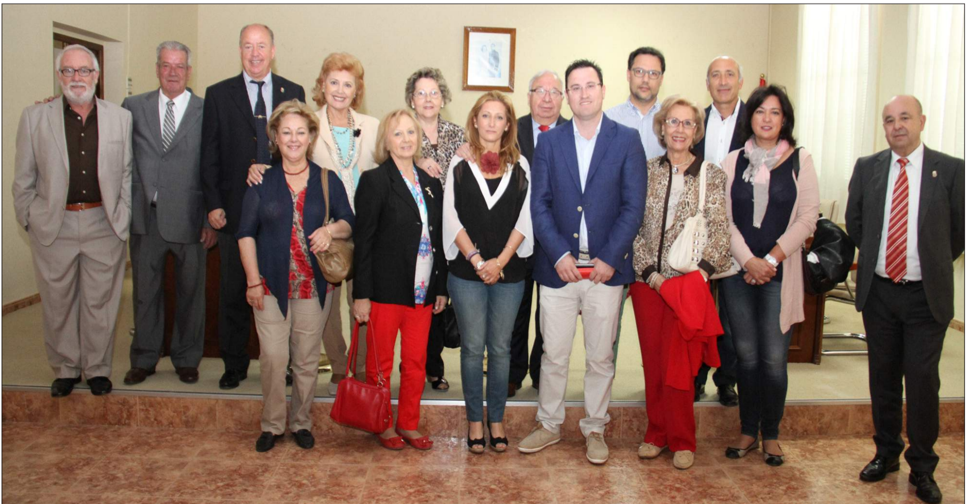
Peñistas y autoridades, antes de iniciarse el acto institucional, en el Ayuntamiento de Sierra de Yeguas.