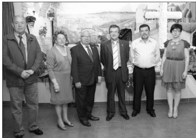
Directivos de la entidad y la Federación, ante la Cruz.