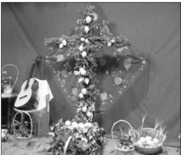
Peña Er Salero.