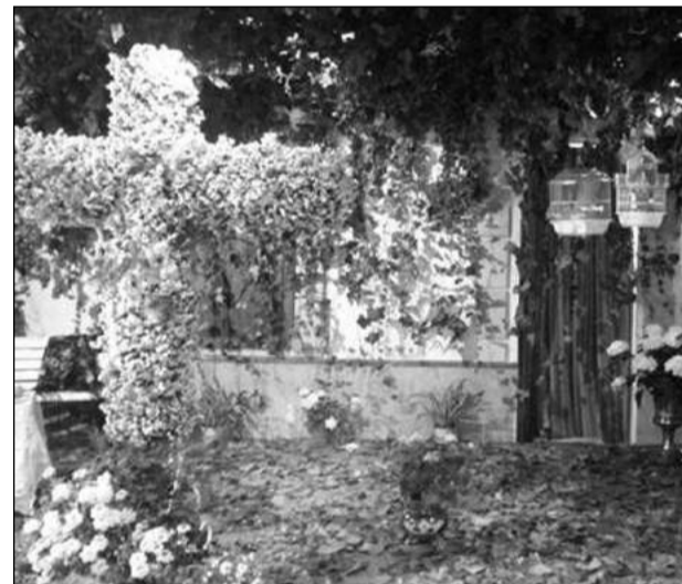
Centro Cultural Renfe.