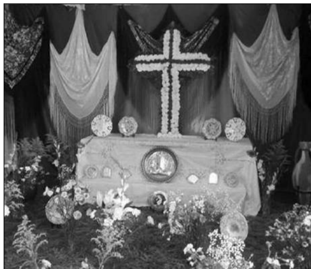
Casa de Melilla en Málaga.