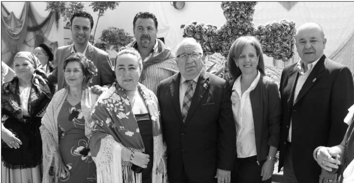
Miembros de la asociación con representantes del mundo político y asociativo.