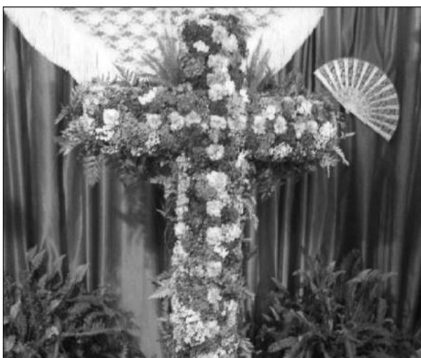
Peña El Seis Doble.