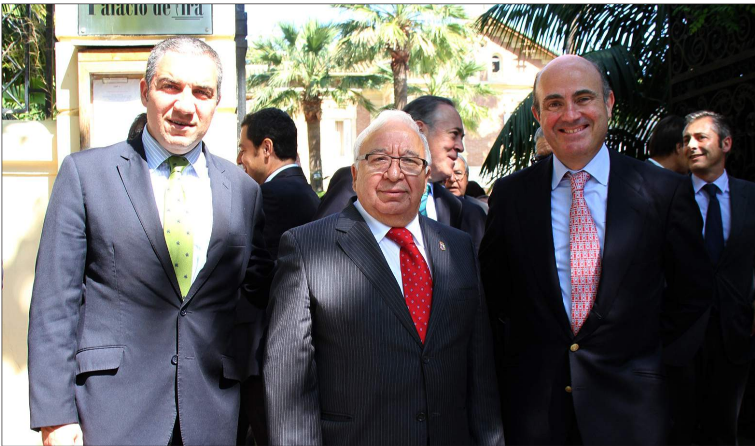
El presidente de la Diputación, Elías Bendodo, el presidente de la Federación de Peñas, Miguel Carmona, y el Ministro de Economía, Luis de Guindos.

Número 549 7 de Mayo de 2014 C/ Pedro Molina, 1 Tfno: 952 22 54 39 Fax: 952 21 48 82 E-mail: prensa@femape.com - la_alcazaba@hotmail.com Web: www.femape.com Edición digital: www.femape.com/laalcazabadigital Twitter: @FMPLaAlcazaba Búsquenos también en Facebook