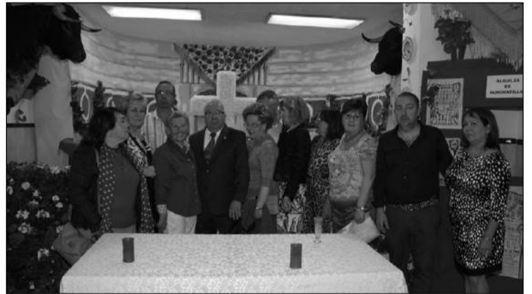
El presidente de la Federación, con otros peñistas junto a la Cruz.