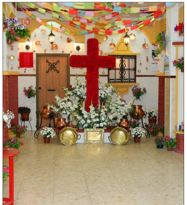
Cruz de la Peña Costa del Sol en 2013, primer premio.

Coca-Cola, la botella contornada, la curva dinámica modificada y el disco rojo son marcas registradas de The Coca-Cola Company.