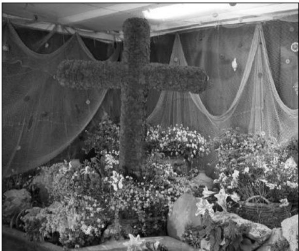
Peña La Virreina.