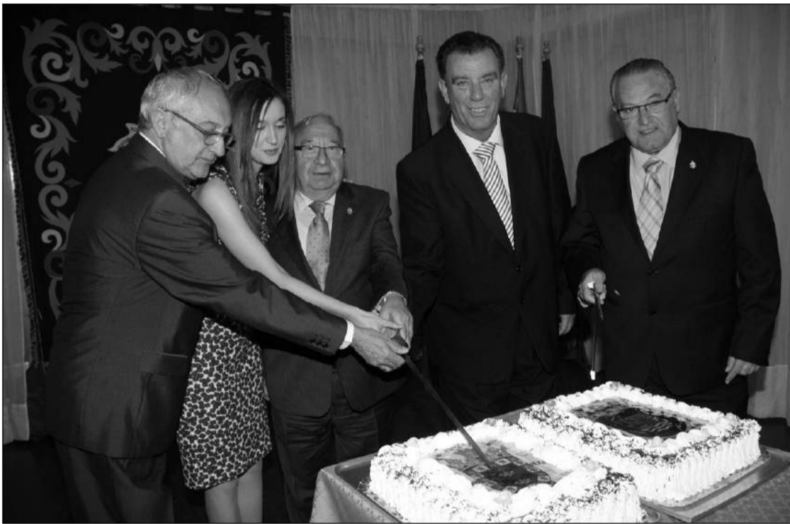
Corte de la tarta conmemorativa del Aniversario.