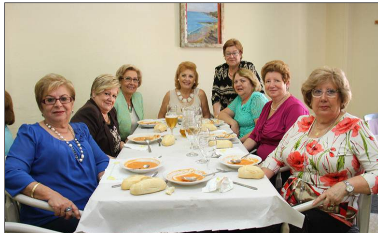
Asistentes a la comida de señoras.