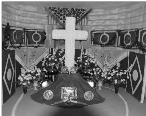
Peña Costa del Sol.