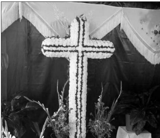
Peña El Sombrero.