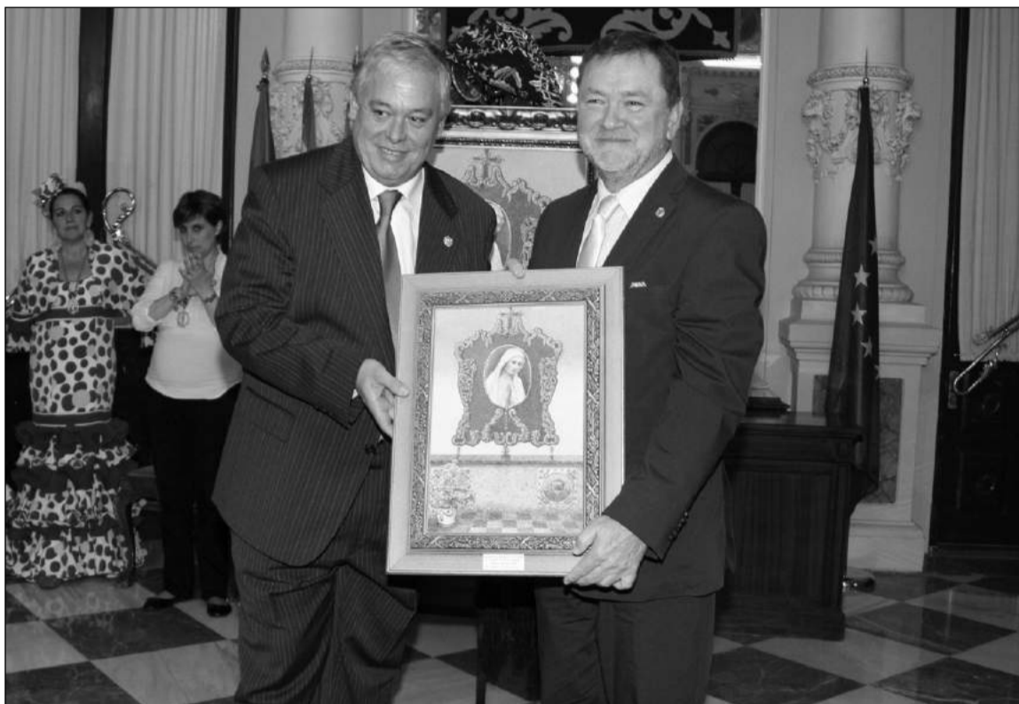
Entrega de un recuerdo al autor del cartel por parte del presidente de la Agrupación de Glorias.