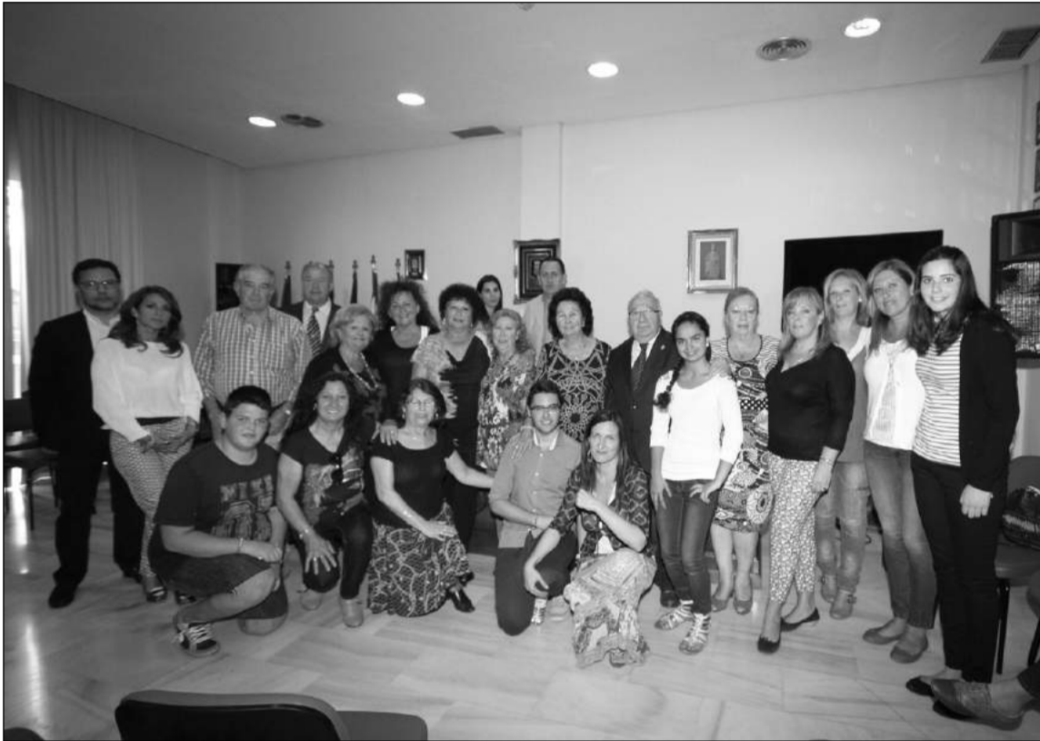
Alumnos y directivos en la inauguración del curso.