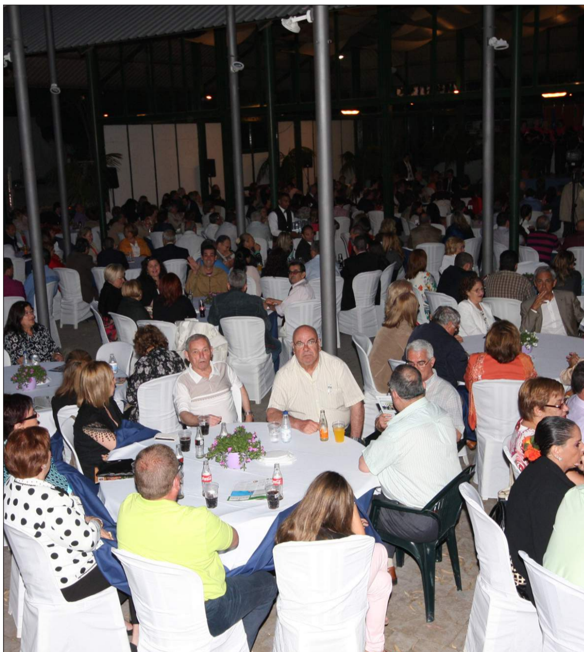
Aspecto que presentaba la Finca La Cónsula el pasado año en la entrega de trofeos y el pregón.

Durante ese periodo se asientan las bases de las estructuras actuales de la Fiesta: concurso de Agrupaciones, Elección de los Dioses del Carnaval, Pregón, entierro del boquerón, himno del carnaval y la proliferación de eventos y actos en lo que al Carnaval de calle se refiere. Desde 2011 vuelve a estar al frente de este colectivo, afrontando nuevos retos en los que se encuentra inmerso.