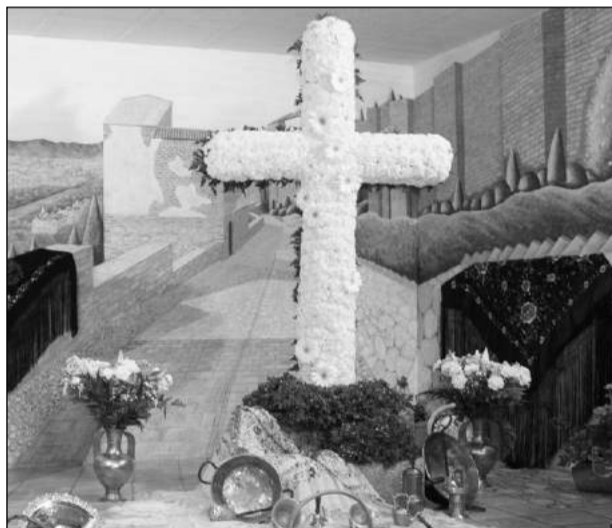
Peña La Biznaga.