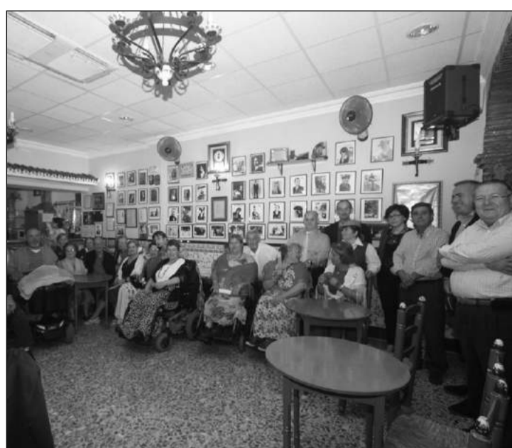
El Centro Cultural Flamenco 'La Malagueña' acogió el 25 de abril una actuación muy especial con la representación de 'La Taberna Gitana' a cargo de los componentes del grupo de teatro Frater.