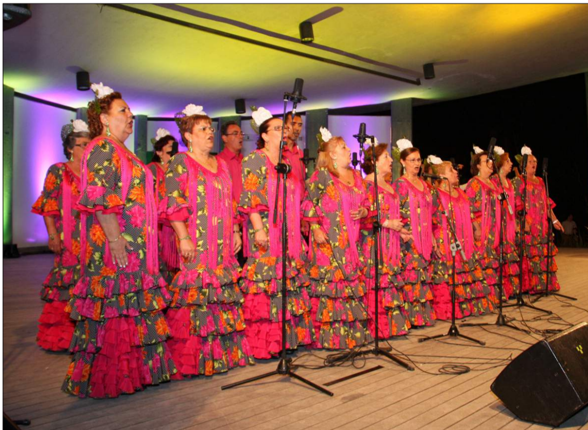
Actuación de uno de los coros participantes en el Certamen de Malagueña de Fiesta del pasado año.

la Federación Malagueña de Peñas, Centros Culturales y Casas Regionales 'La Alcazaba', organiza el Certamen de Malagueñas de Fiesta "Memorial José María Alonso", con el objetivo de potenciar el cante y el baile de la malagueña popular, siendo el objeto del concurso la propia composición, interpretada por solistas, grupos o coros.