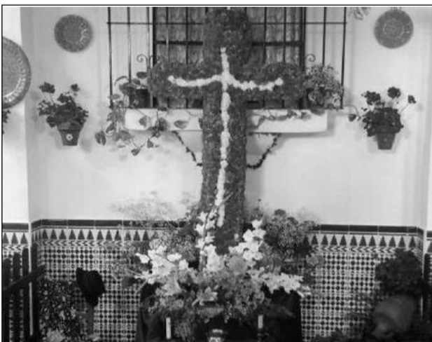
Asociación de Vecinos Ciudad Jardín.