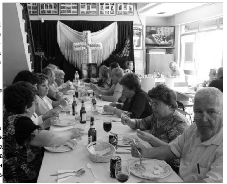
Comida de hermandad, con la Cruz de Mayo al fondo.