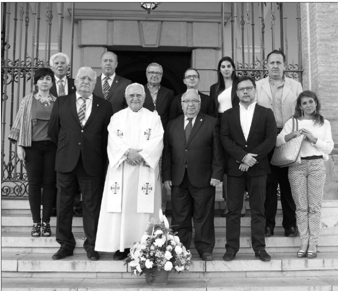
Representantes de la Federación y de la Real Hermandad, a las puertas del templo.