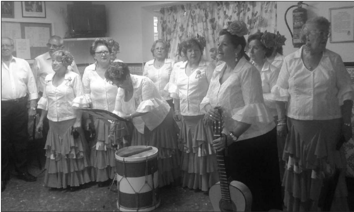
El coro de la entidad, en la fiesta con motivo de la Cruz de Mayo.