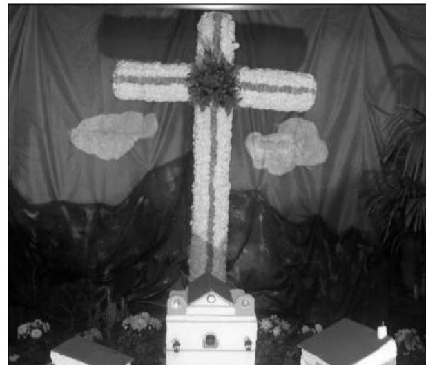
Asociación Cultural Amanecer.