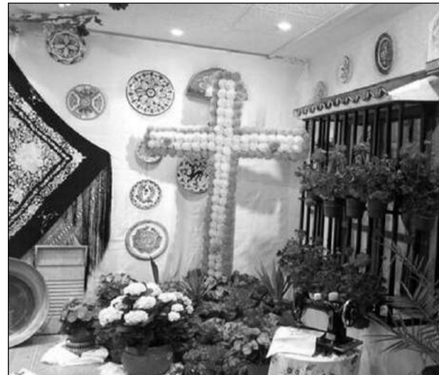
Peña El Parral.