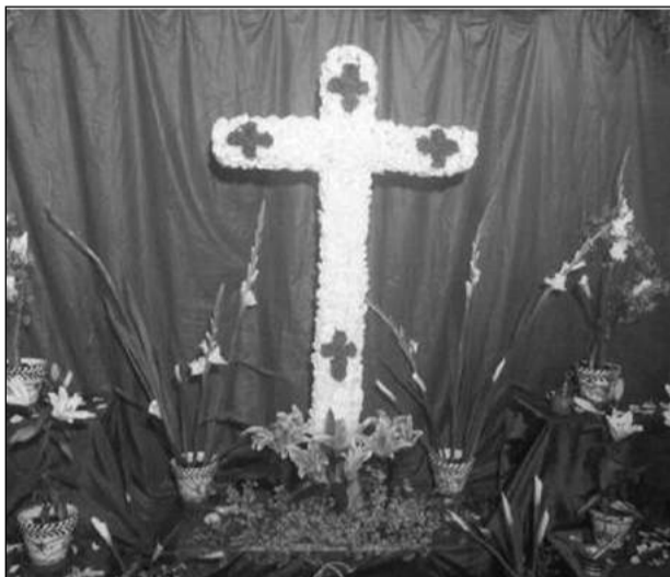
Asociación Cortijo La Duquesa.