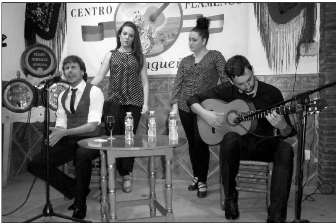
Un instante de la actuación flamenca.