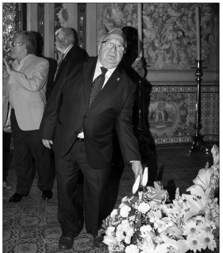
El presidente Miguel Carmona deposita una canastilla en el camarín.