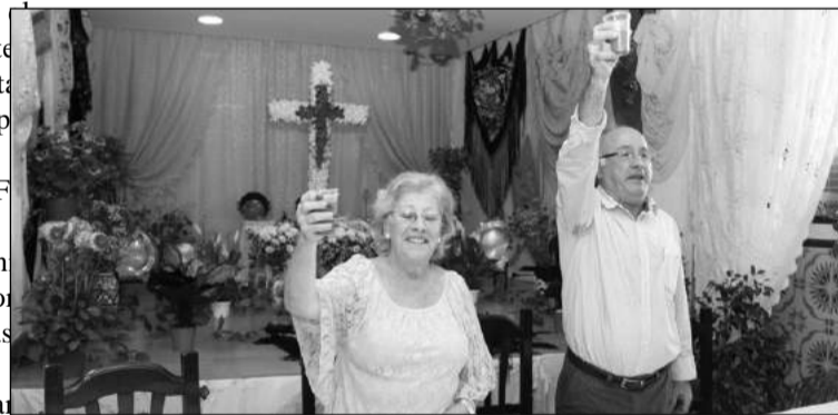
Brindis ante la Cruz.

merienda con motivo del Día de la Madre; así como para inaugurar la Cruz de Mayo que han instalado.