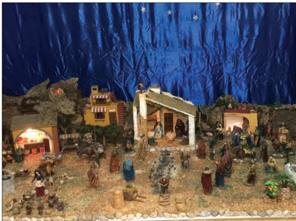
Agrupación Cultural Telefónica.