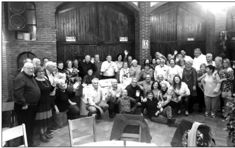
Imagen de grupo de los participantes en la Comida Anual.