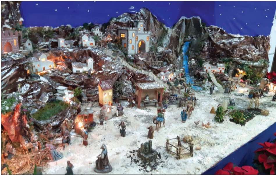
Peña Cruz de Mayo.