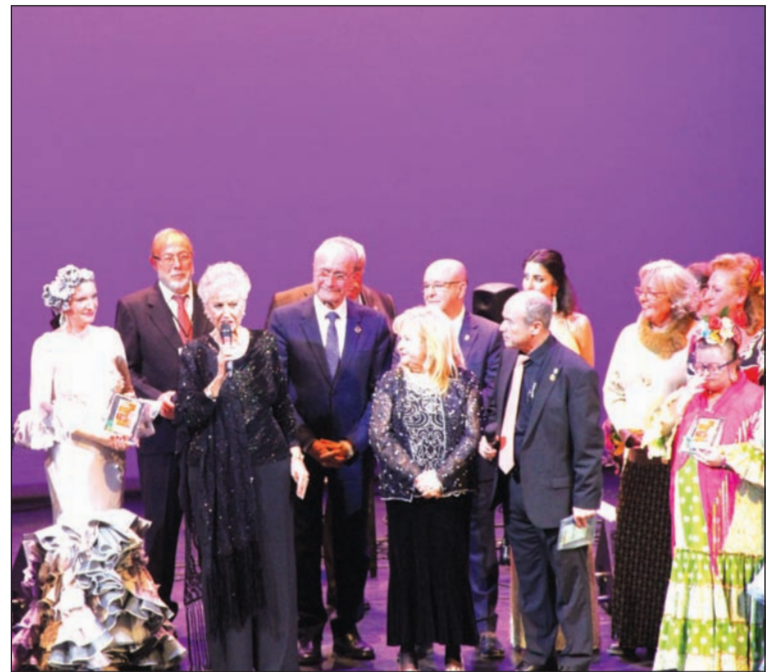
Un instante del homenaje realizado en el Teatro Cervantes.