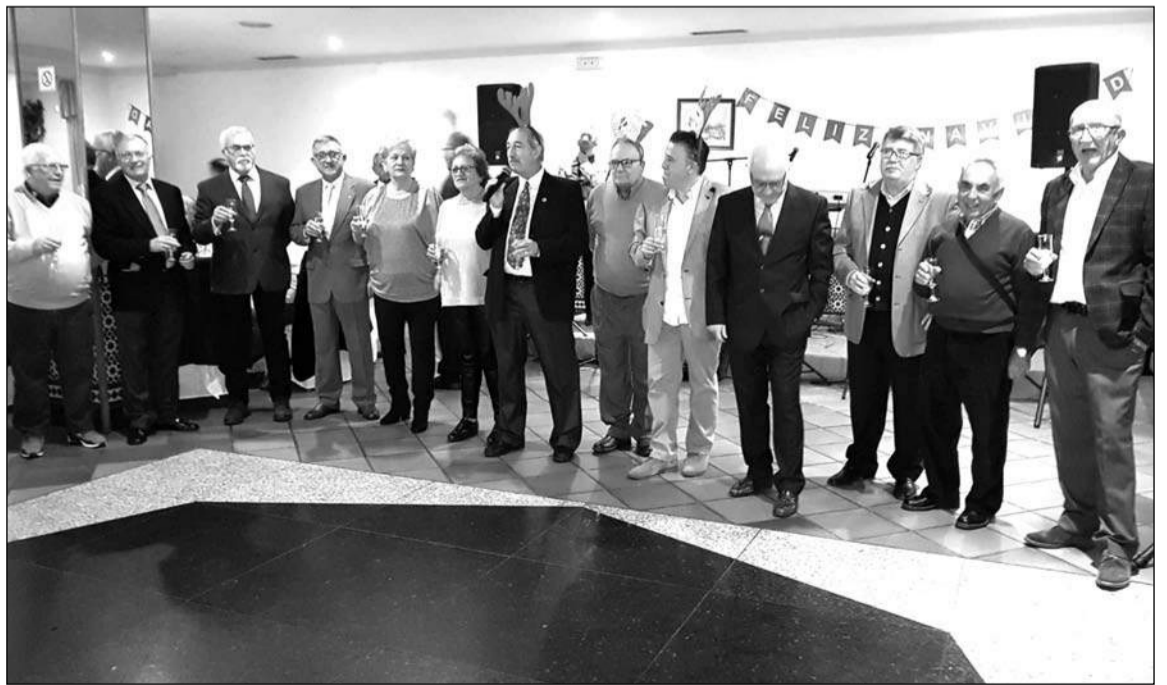
Brindis durante la comida navideña.