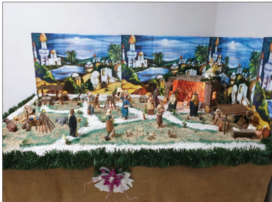
Peña Er Salero.