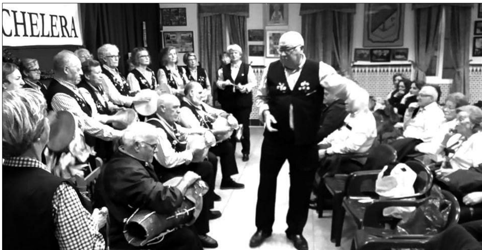
Actuación de la pastoral de la Asociación de Vecinos Zona Europa.