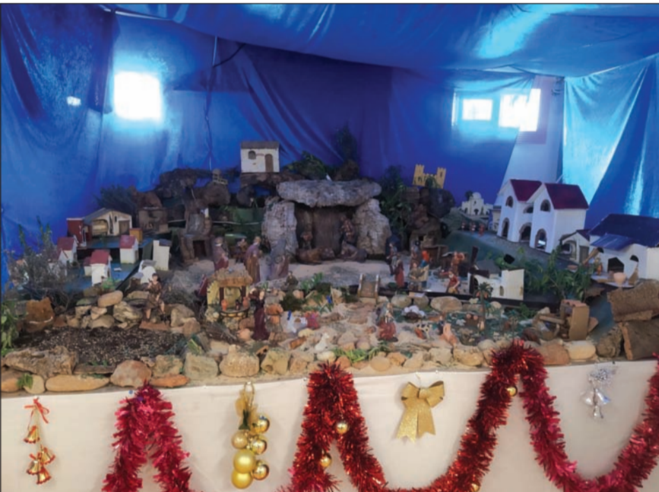
Peña La Virreina.