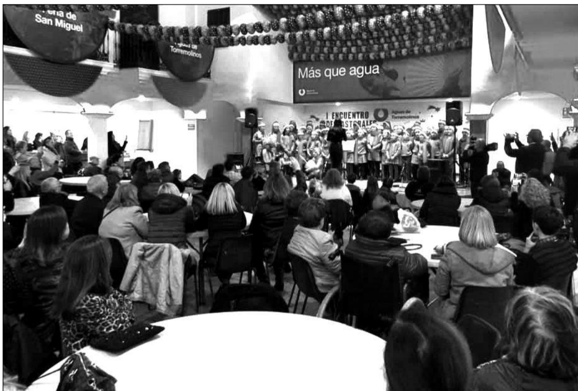
Junto a las pastorales tradicionales también intervino un coro escolar.

eración Malagueña de Peñas, Centros Culturales y Casas Regionales 'La Alcazaba' se promovía una visita cultural de sus componentes a la ciudad de Málaga en la jornada del 6 de diciembre.