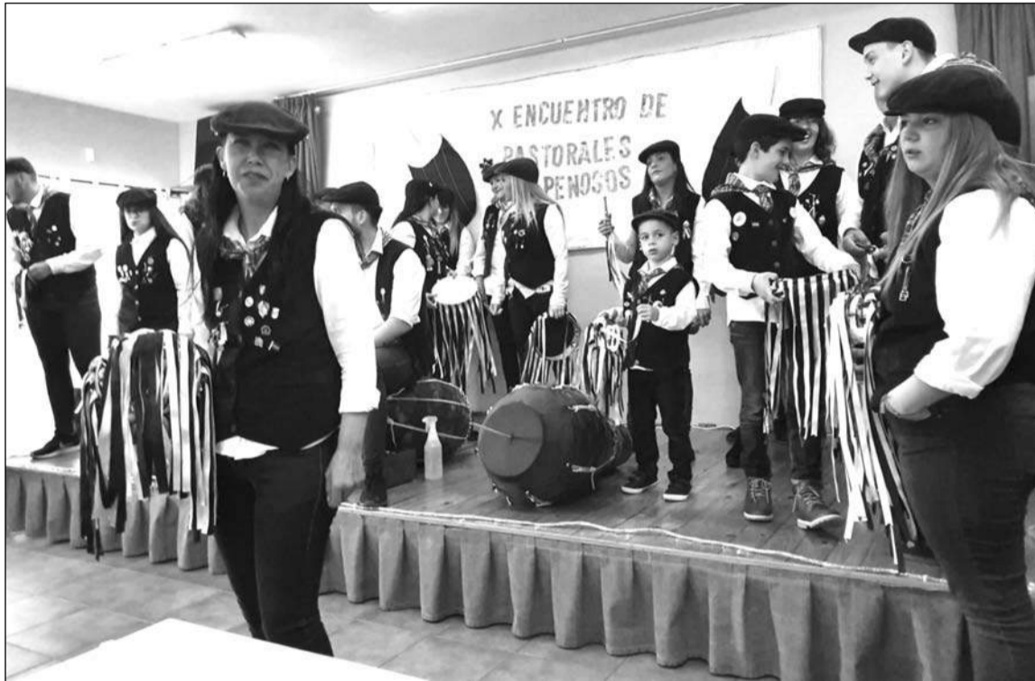
Un momento del encuentro celebrado en la sede de la Peña Los Penosos.