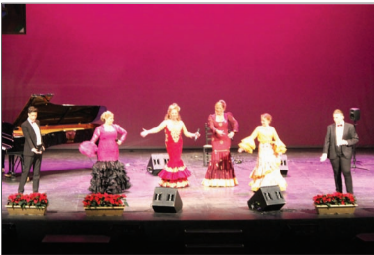
Un instante del espectáculo.