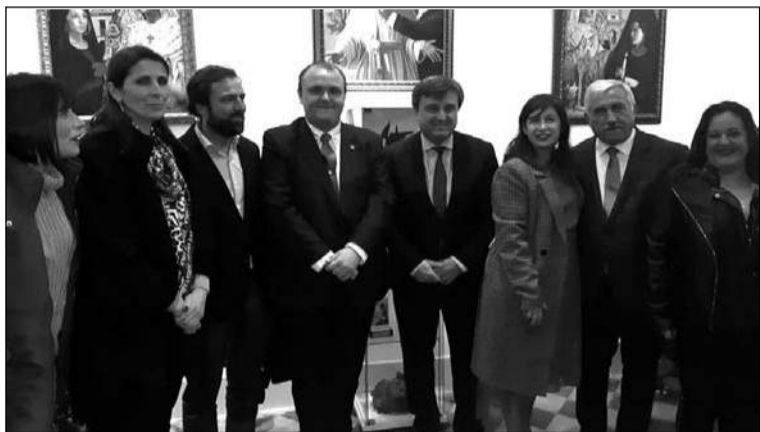
Algunas de las autoridades asistentes.