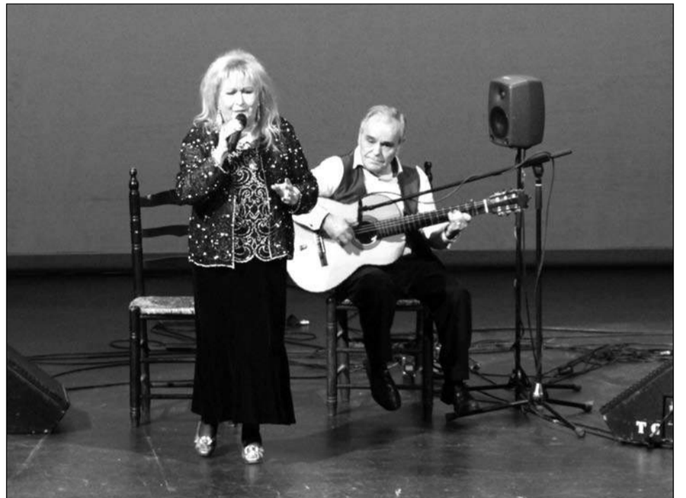
Actuación de Gloria de Málaga.