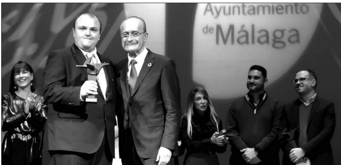
El presidente José Ocón recoge el premio de manos del alcalde Francisco de la Torre.

Una de las primeras actividades a desarrollar en la nueva sede será este viernes 20 de diciembre con una Merienda Navideña a partir de las 17:30 horas en la plaza del Patrocinio. Al día siguiente, el coro irá cantando por las calles villancicos tradicionales con intención de crear ambiente navideño que apoye el consumo y la compra en los comercios dentro de su campaña denominada 'En Navidad Compra en Tu Barrio'.