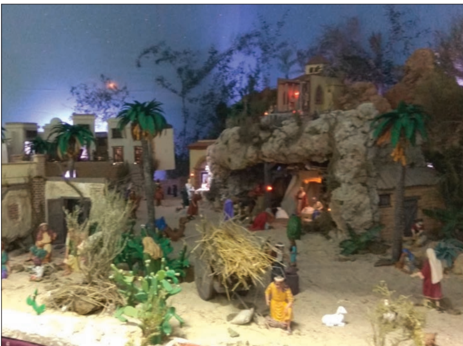
Asociación de Vecinos Hanuca.