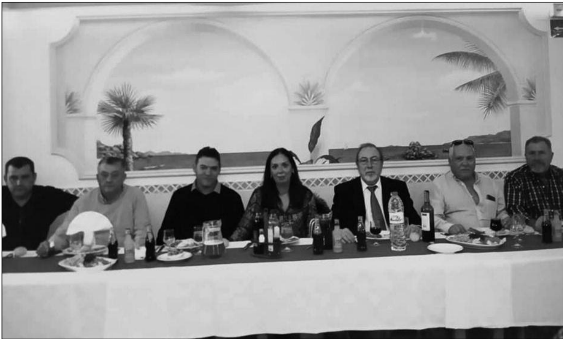
Mesa presidencial en la celebración del aniversario.