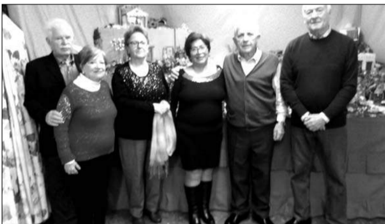
Inauguración del Belén.