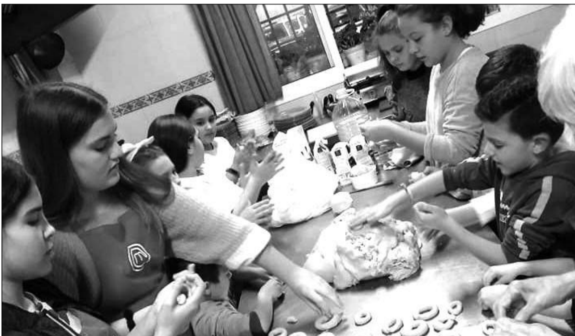
Proceso de elaboración de las rosquillas que prepararon los niños del Centro Cultural Renfe.

La primera actividad anunciada para 2020 será el 4 de enero, cuando se reunirán las mujeres; mientras que el 14 de ese mismo mes arrancará un nuevo torneo de chinchón, dominó, parchís y rana.