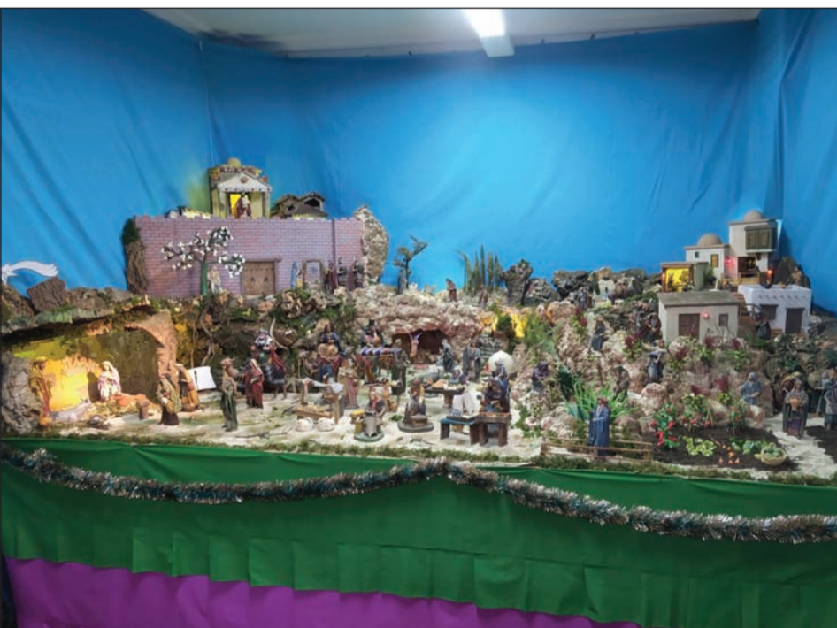
Peña Los Rosales.