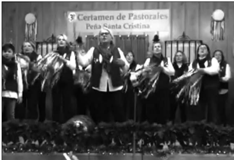
Imagen de la actuación de la pastoral anfitriona.

La Pastoral de la Peña Santa Cristina está desarrollando una intensa actividad durante estos meses de diciembre, con su presencia de actos muy diversos.