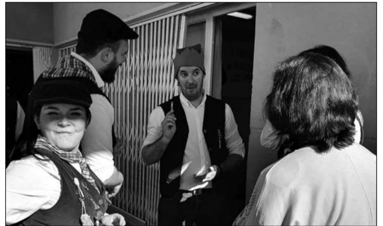
Integrantes de la pastoral dan la bienvenida a los asistentes.

Las actividades concluirá el 5 de enero, a partir de las 17:30 horas, con merienda infantil.