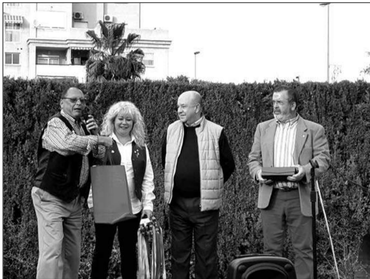
Entrega de recuerdos en el encuentro de pastorales.

No ha faltado tampoco su Certamen de Pastorales, celebrado el pasado fin de semana.