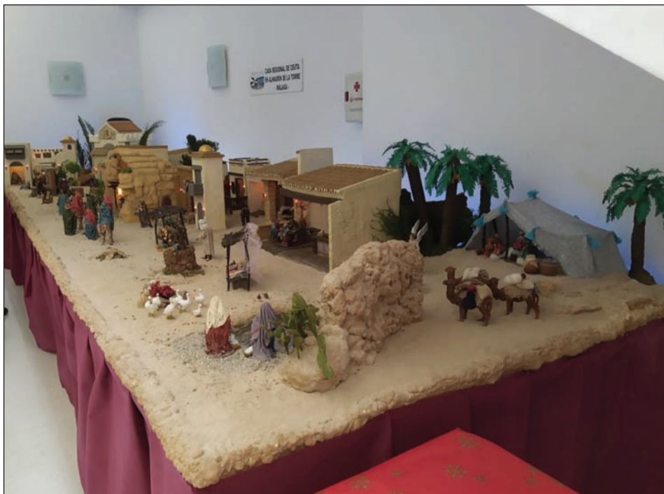
Casa de Ceuta en Alhaurín de la Torre.