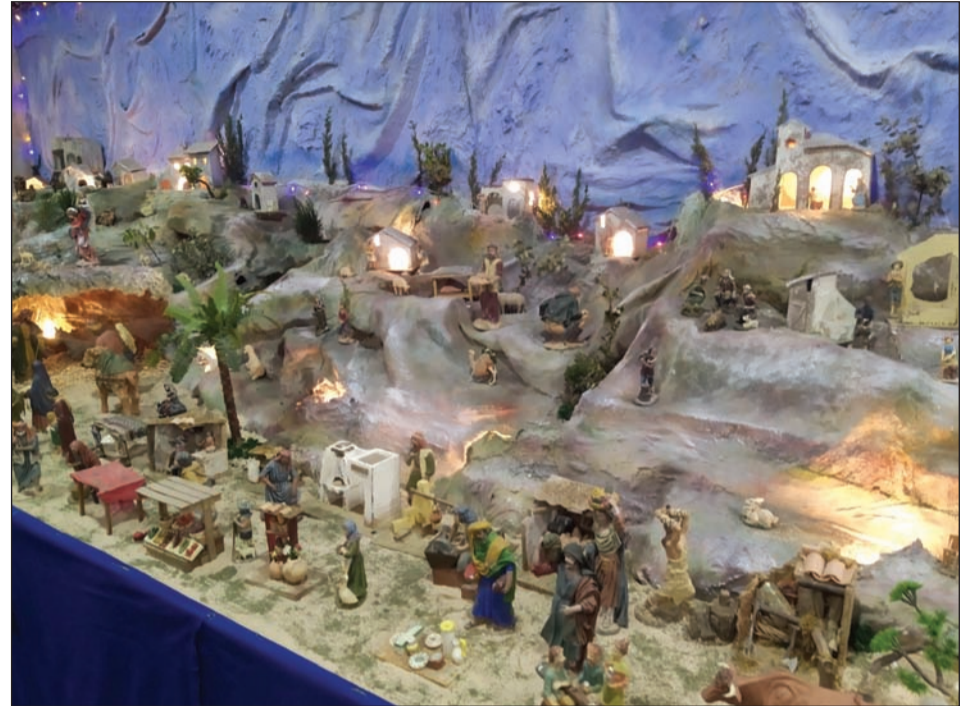
Casa de Álora Gibralfaro.