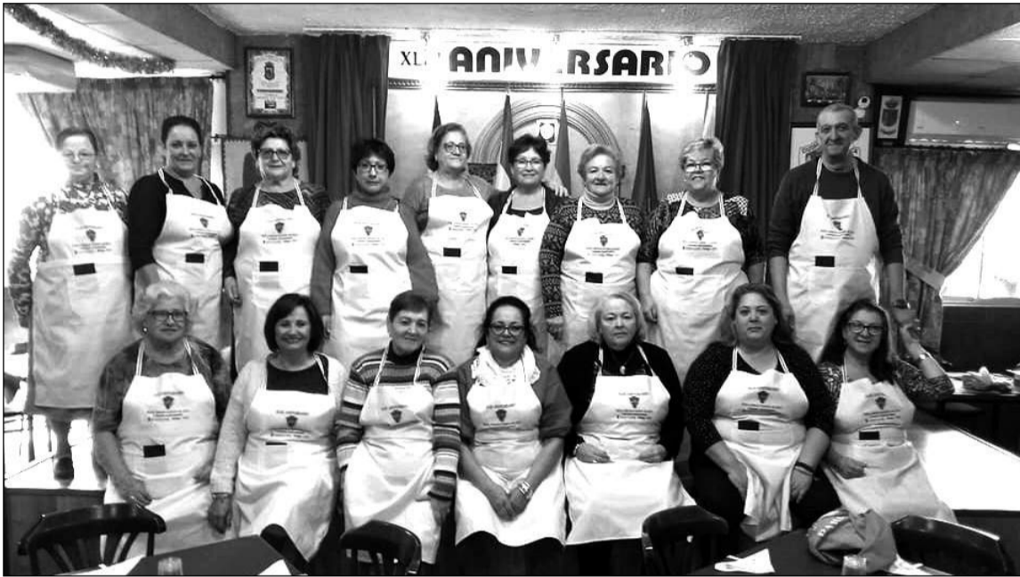
Participantes en el Concurso Gastronómico del Aniversario.