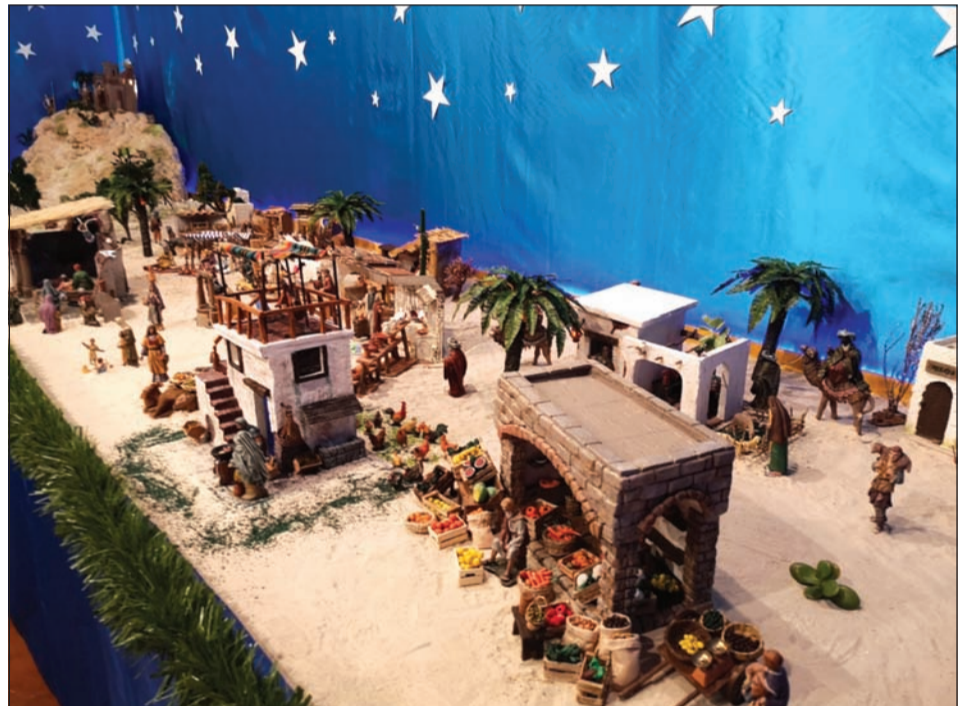
Casa de Melilla.