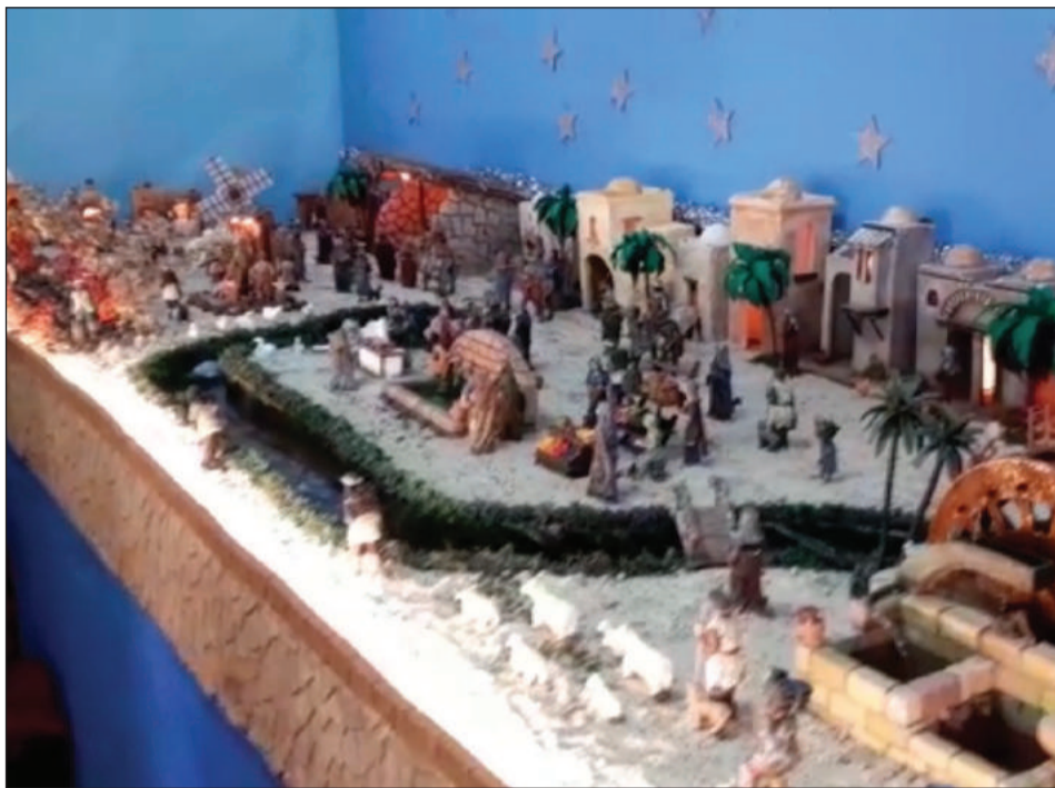
Peña Cultural Malaguista de Ciudad Jardín.