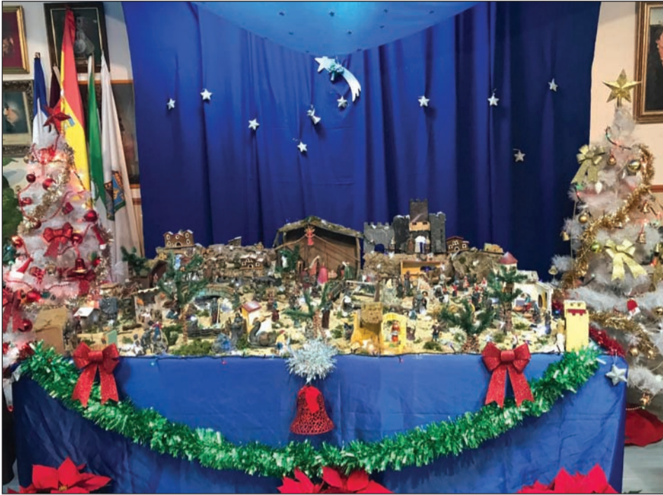
Peña San Vicente.