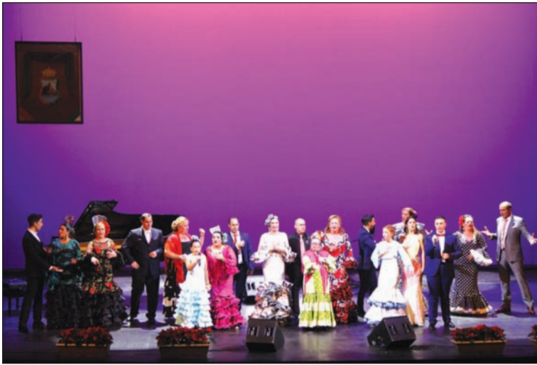
Actuación coral de los alumnos de la Escuela de Copla 'Miguel de los Reyes'.