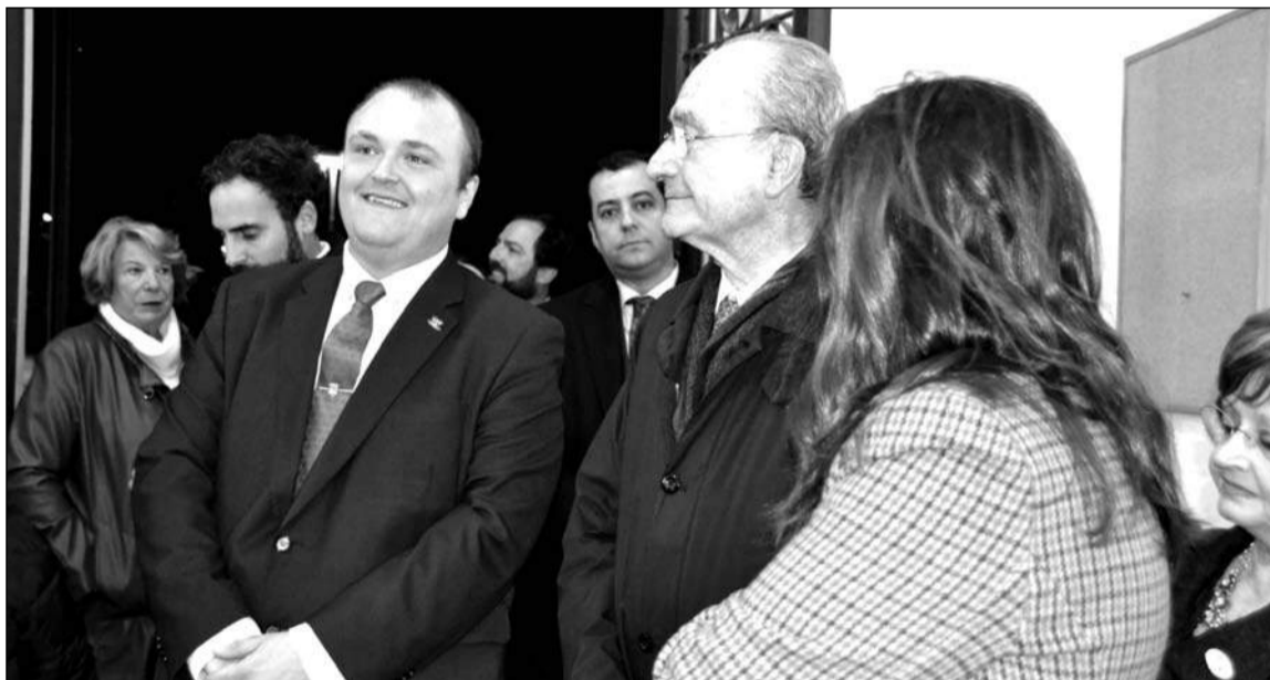
El alcalde no quiso faltar a la inauguración de la sede.