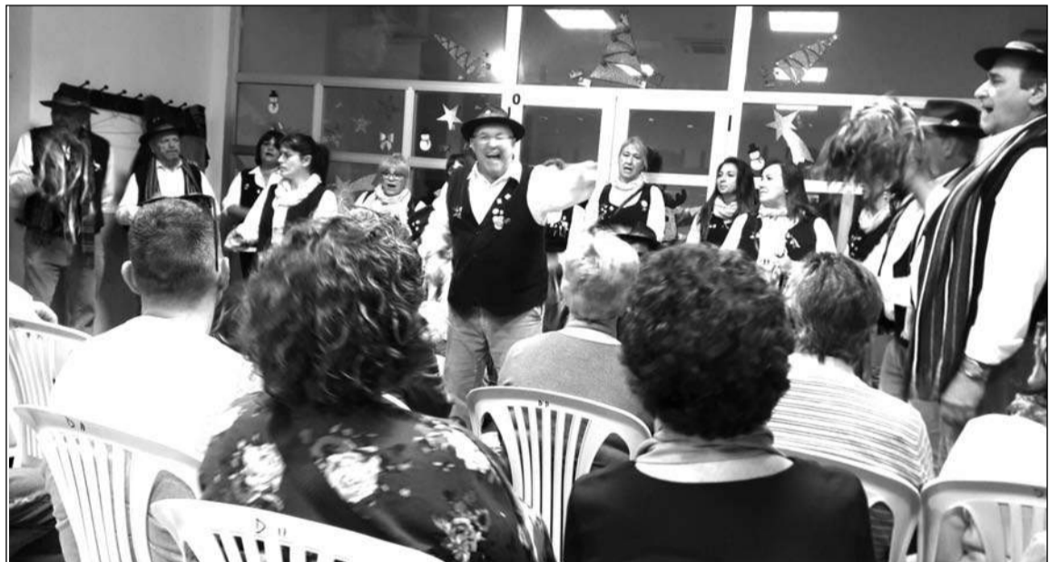
Actuación de la Pastoral del Centro Cultural Renfe.