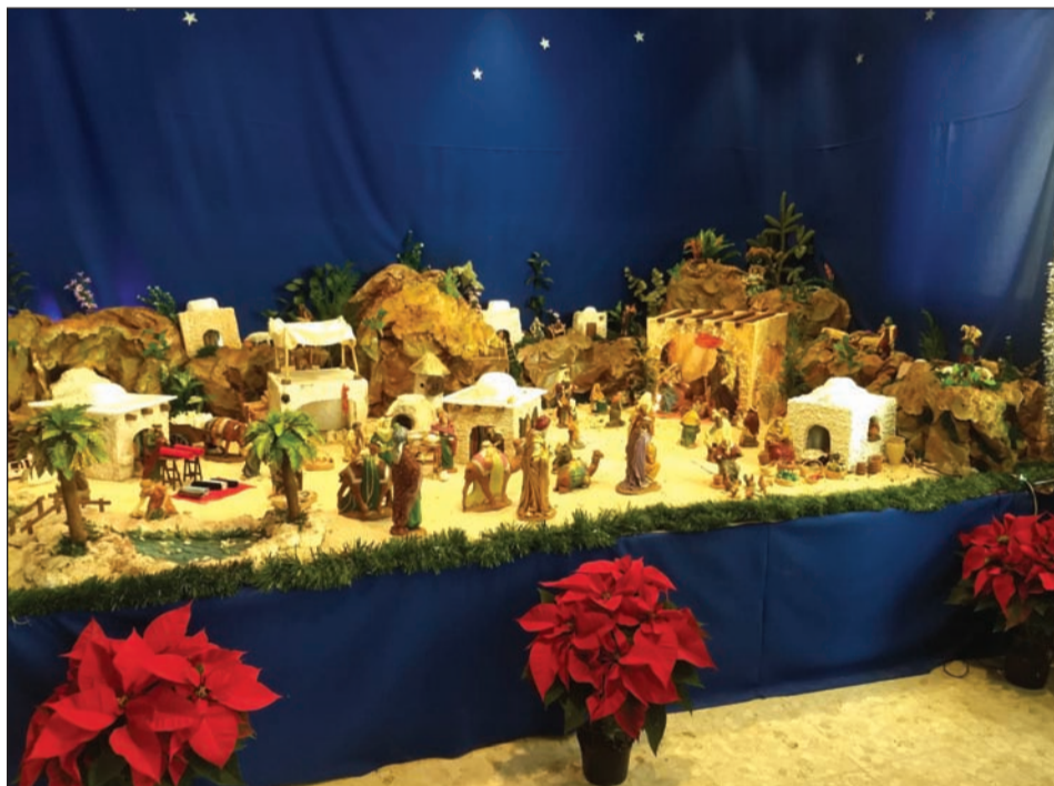
Peña Nueva Málaga.