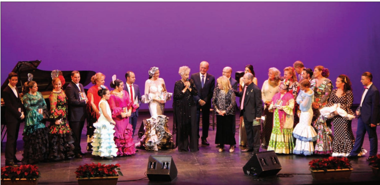
Los alumnos de la Escuela de Copla 'Miguel de los Reyes' protagonizaron una gala de homenaje a dos grandes artistas.

Número 690 18 de Diciembre de 2019 C/ Pedro Molina, 1 Tfno: 952 60 33 43 E-mail: prensa@femape.com - fmpalcazaba@gmail.com Web: www.femape.com Edición digital: www.femape.com/laalcazabadigital Twitter: @FMPLaAlcazaba Facebook: www.facebook.com/FMPLaAlcazaba