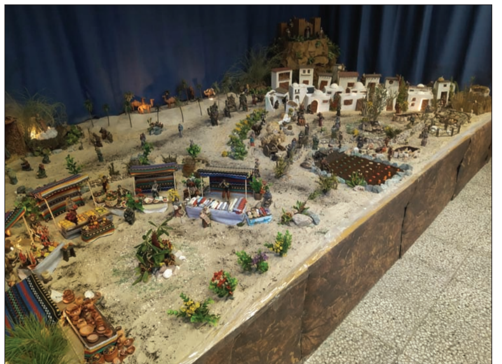
Peña Cortijo de Torres.