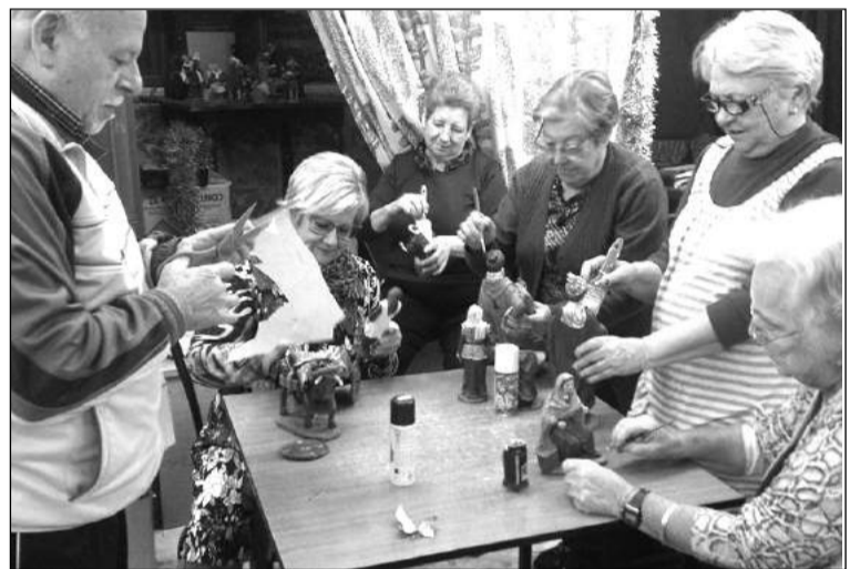
Socios realizando trabajos manuales.

Este es el resultado del trabajo realizado por un grupo de socios que han convertido la sede en un taller belenista del que han salido figuras pintadas y otras piezas que conforman el Portal instalado para estas fiestas y alrededor del cual giran todas las actividades programadas para las próximas semanas.