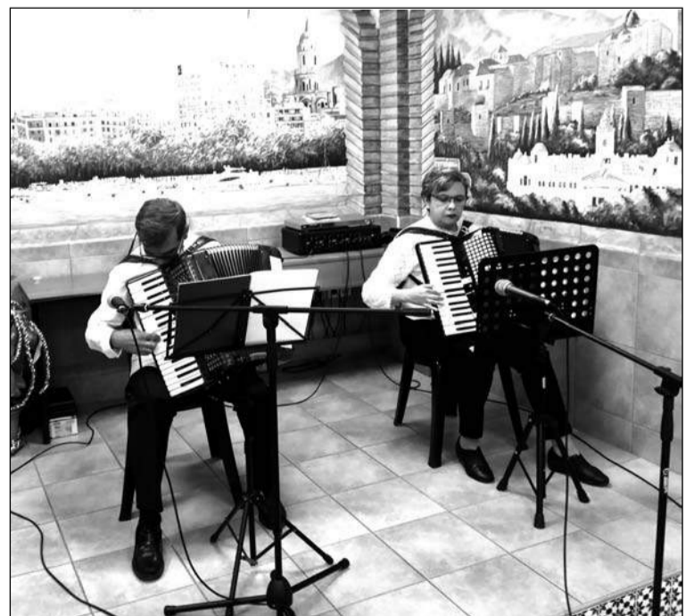
Un instante del recital.

Ya adentrándonos en las fiestas, los socios están convocados el 21 de diciembre, también a las 20:30 horas, para realizar un Canto a la Navidad; mientras que el 28 de este mismo mes, coincidiendo con el Día de los Santos Inocentes, tendrá lugar una fiesta especial dedicada a los niños.