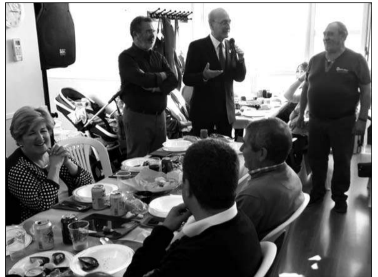
Intervención del alcalde durante su visita a la entidad.

Además, desde Hanuca se está desarrollando una campaña solidaria con la Ciudad de los Niños.