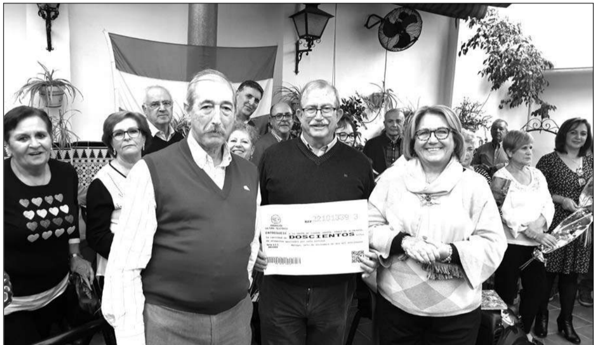
Entrega de la recaudación de los Callos Solidarios para el Banco de Alimentos de Ciudad Jardín.

Las fiestas siguen y las actividades con ellas... Continuará.