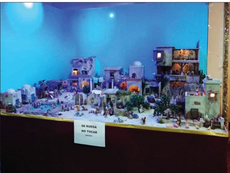
Peña El Parral.