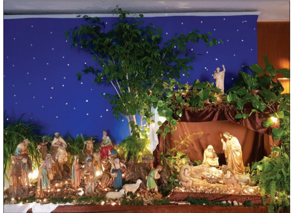
Peña El Sombrero.