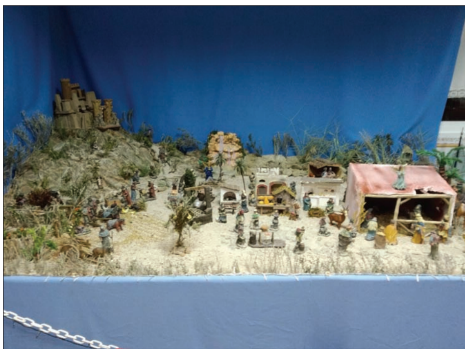
Peña Colonia Santa Inés.