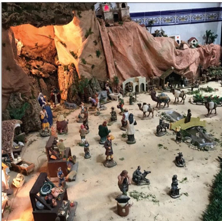
Peña La Asunción.