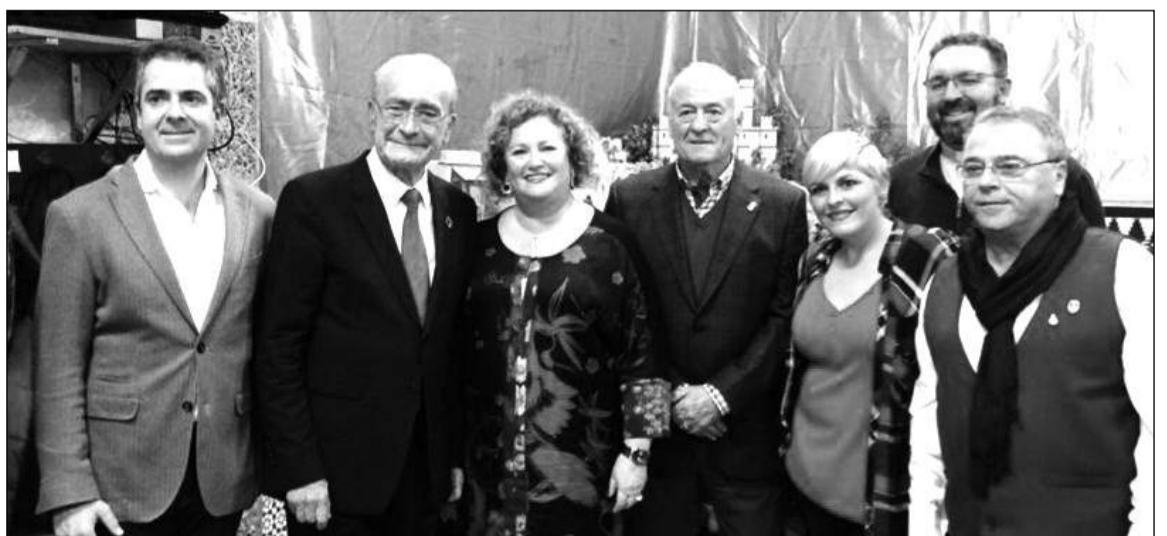
Autoridades e invitados a este acto, con la presidenta de la peña.