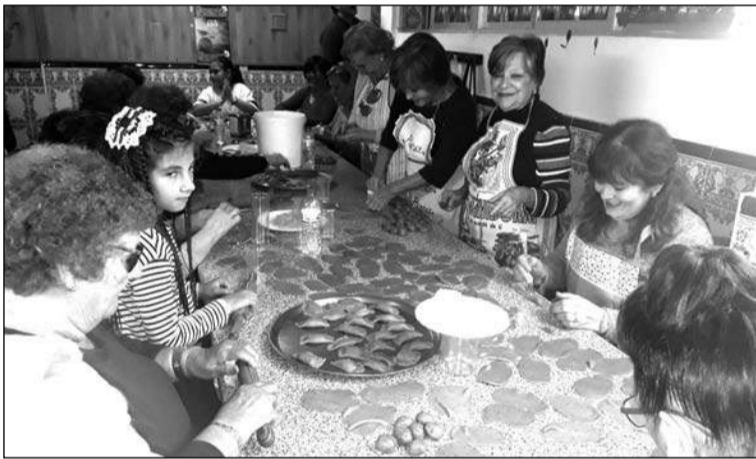
Elaboración de dulces navideños.

Entre tanto, y al margen de las actividades navideñas, la entidad está disputando su tradicional Torneo de Dominó y Parchís, que se prolongará hasta el 20 de febrero y su entrega de trofeos será el 7 de marzo en un hotel de Benalmádena.