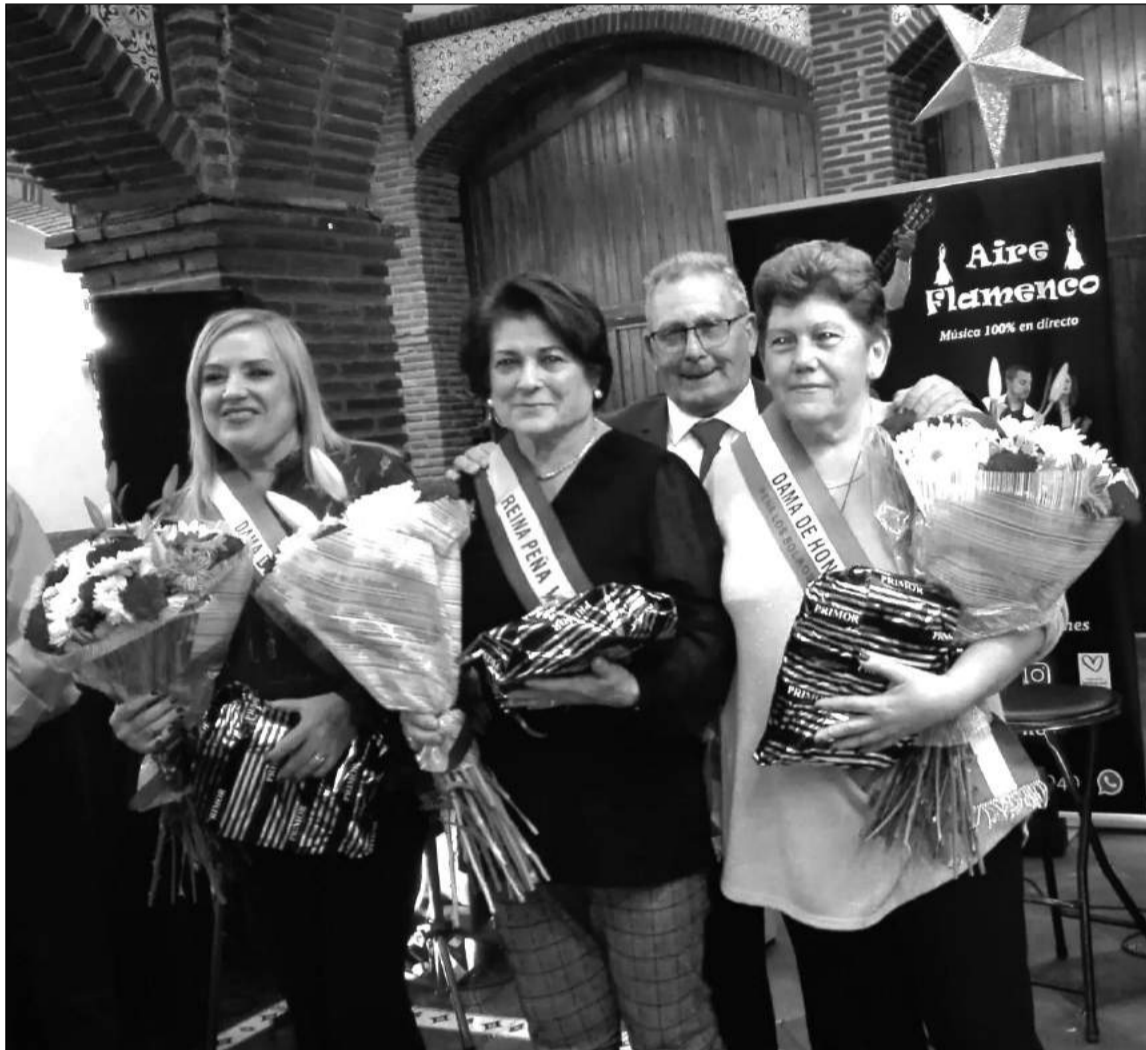
Nombramiento de la Reina de la Peña Los Bolaos y sus Damas de Honor.