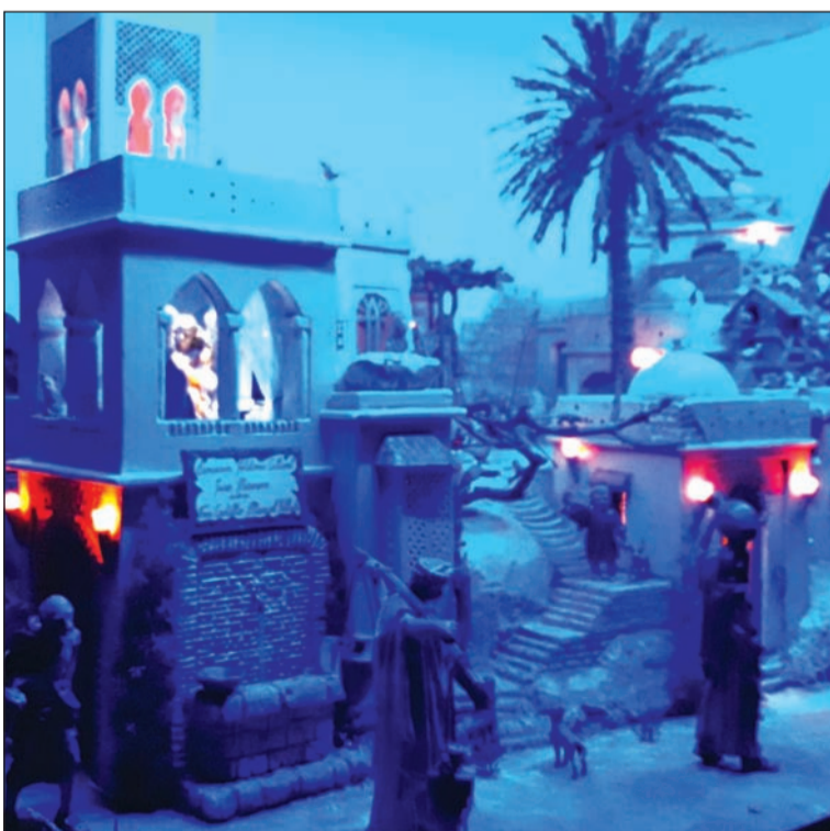
Asociación Folclórico Cultural Juan Navarro