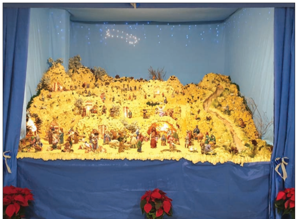
Peña Costa del Sol