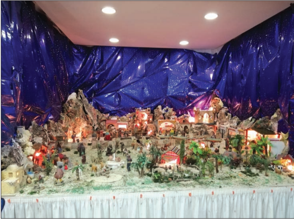
Peña Los Ángeles.