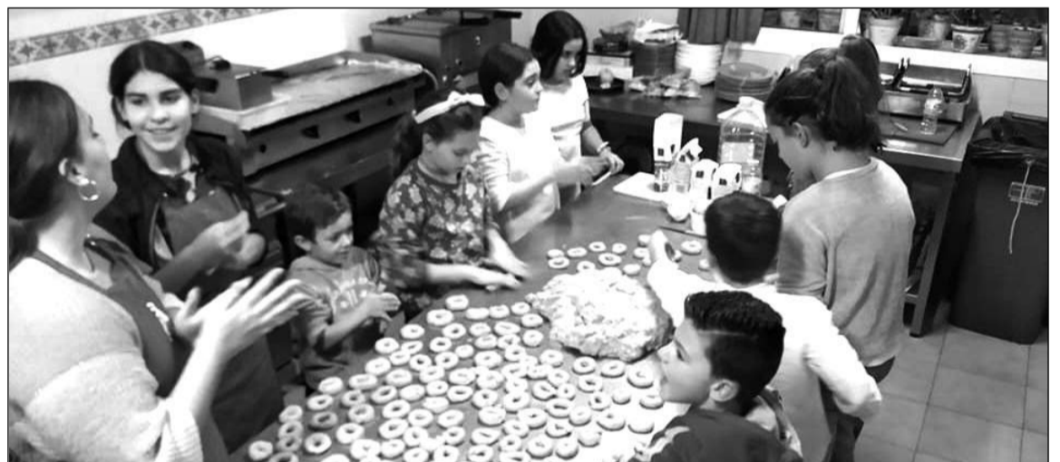
Los pequeños, con las manos en la masa.

Lo mejor de todo, como no podía ser de otro modo, fue el