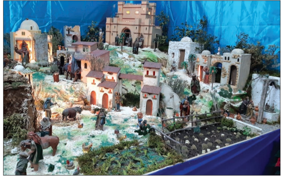
Peña El Palustre.