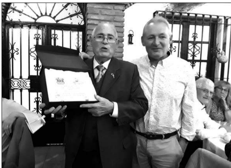
Zambomba anunciada para el 20 de diciembre.

Por otra parte, el pasado fin de semana, en este caso en su sede, se celebraba una comida de hermandad entre los socios en la que se prepararon papas a lo pobre con filete y huevo, aparte de los entremeses.