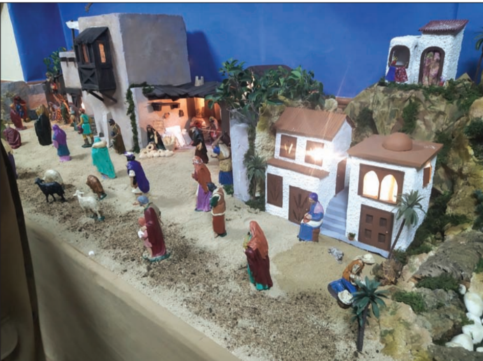
Centr Cultural Renfe.