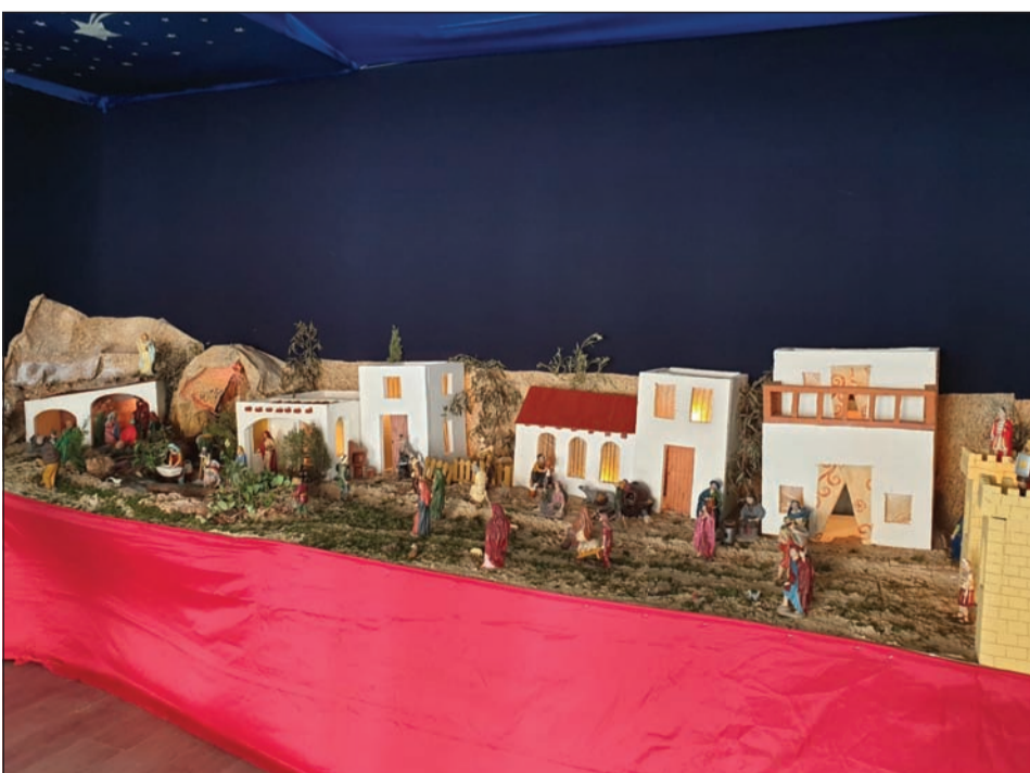
Asociación de Vecinos Zona Europa.