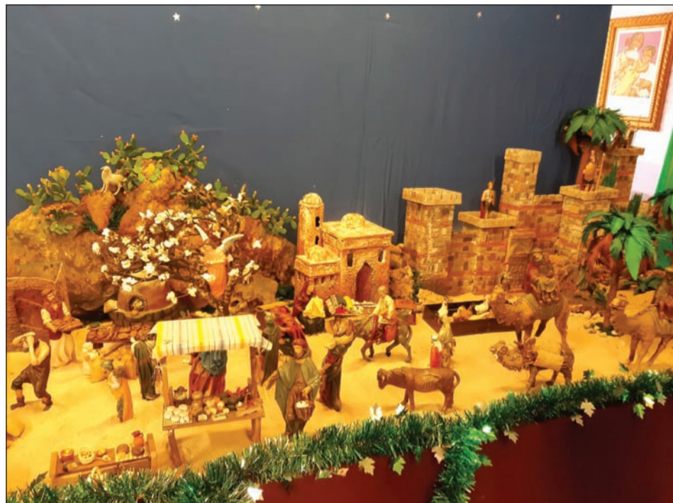
Peña La Biznaga.