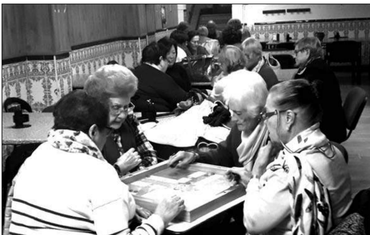
Socias disputan el torneo de parchís.