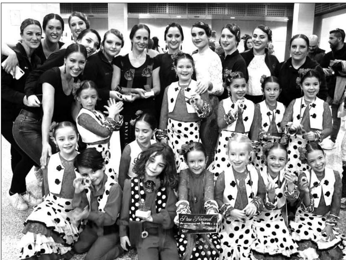
Integrantes de los grupos premiados.