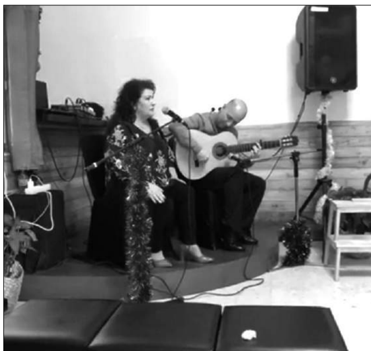
Imagen de la actuación.

Además, la peña ha realizado una campaña de alimentos no perecederos para el Banco de Alimentos.