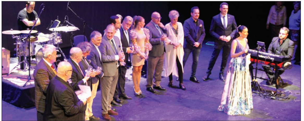
Entrega de recuerdos al jurado.