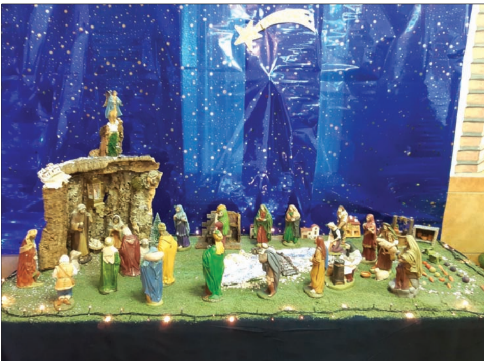
Peña Montesol Las Barrancas.