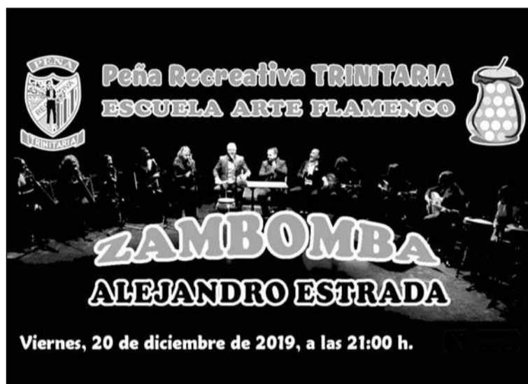
Cartel del certamen.