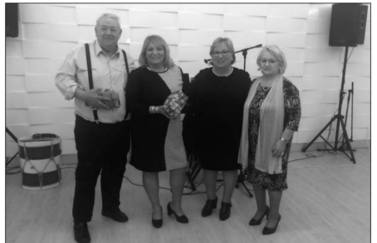
Entrega de recuerdos.

Con tal motivo, los socios se trasladaron hasta Valtari Eventos, donde disfrutaron de una agradable actividad marcada por el buen ambiente entre todos los asistentes.