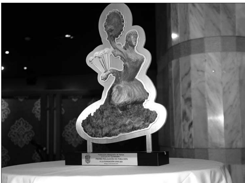
El trofeo del Premio Malagueño de Pura Cepa ha sido renovado en esta edición.