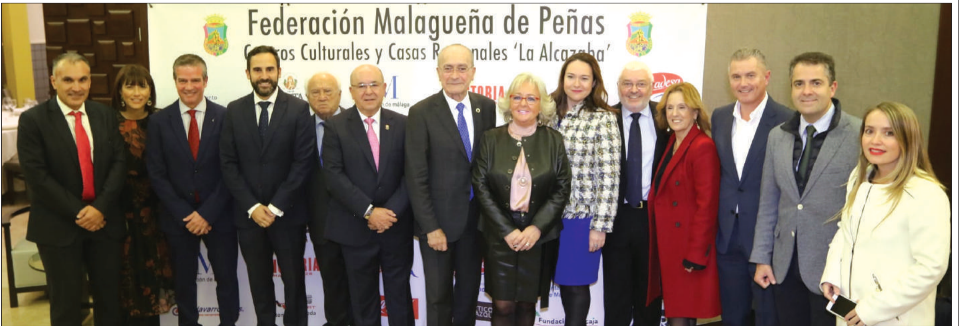
Imagen de autoridades y patrocinadores asistentes a esta conmemoración, que tenía lugar el pasado 23 de noviembre en el restaurante Pórtico de Velázquez.

Número 689 4 de Diciembre de 2019 C/ Pedro Molina, 1 Tfno: 952 60 33 43 - 674 68 12 64 E-mail: prensa@femape.com - fmpalcazaba@gmail.com Web: www.femape.com Edición digital: www.femape.com/laalcazabadigital Twitter: @FMPLaAlcazaba Facebook: www.facebook.com/FMPLaAlcazaba