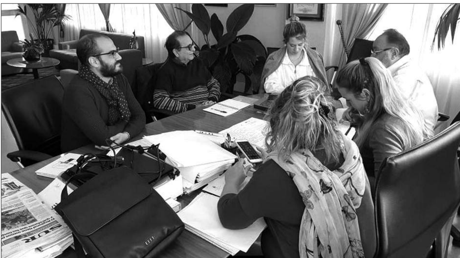
Imagen de la reunión mantenida en el Ayuntamiento de Alhaurín de la Torre.