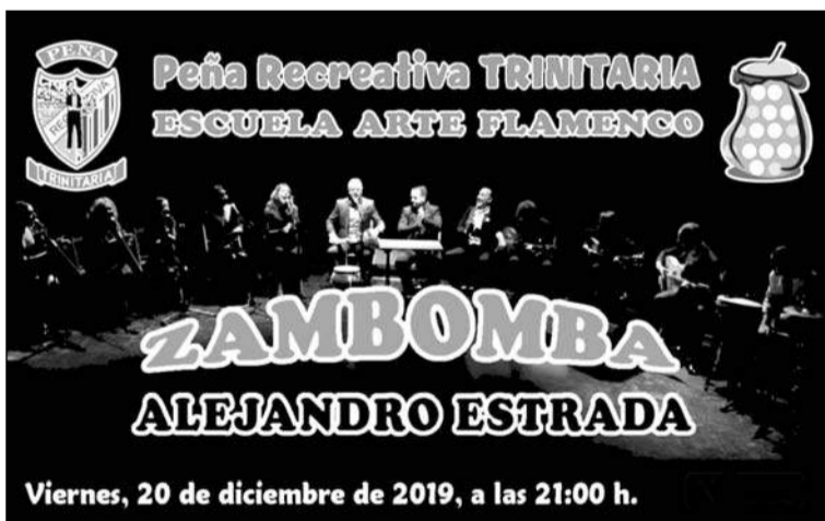
Zambomba anunciada para el 20 de diciembre.