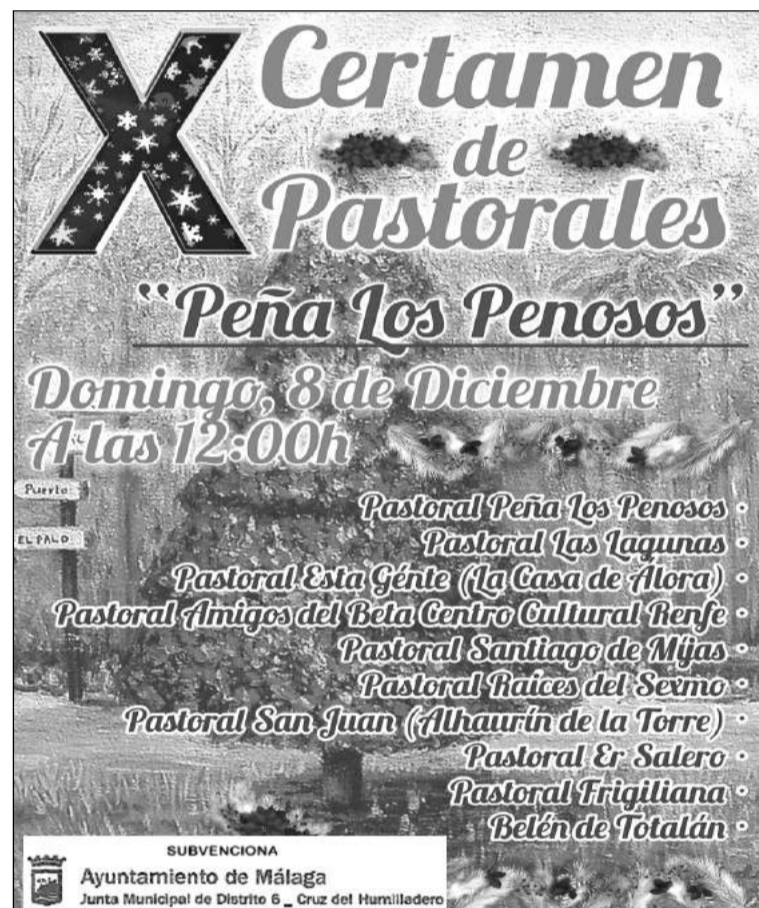
Cartel del certamen.

Las actividades concluirá el 5 de enero, a partir de las 17:30 horas, con merienda infantil para los más pequeños