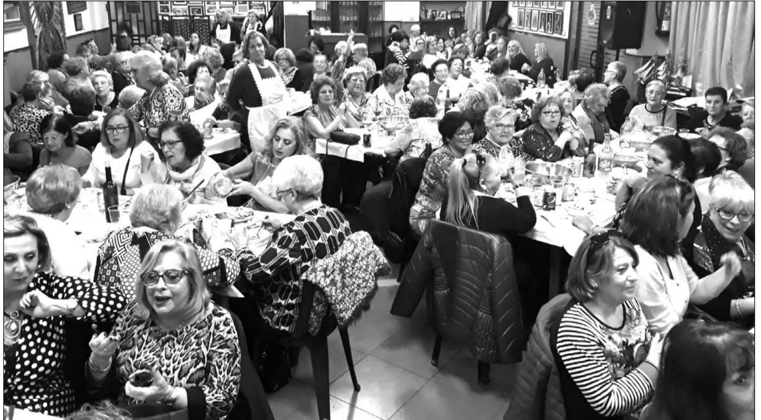
Vista general del salón de la Peña La Paz durante la Comida de Mujeres.

pararon igualmente sorteos de diferentes productos como gentileza hacia las asistentes.