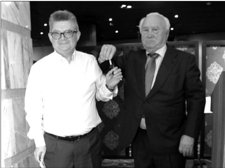
Entrega de las llaves de la motocicleta cedida por Navarro Hermanos.