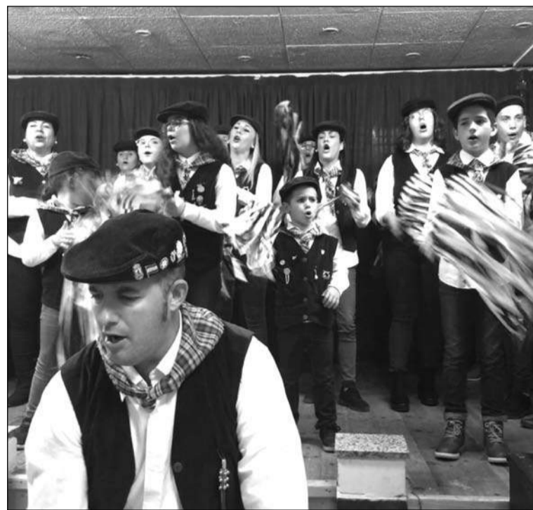
Una de las pastorales invitadas.