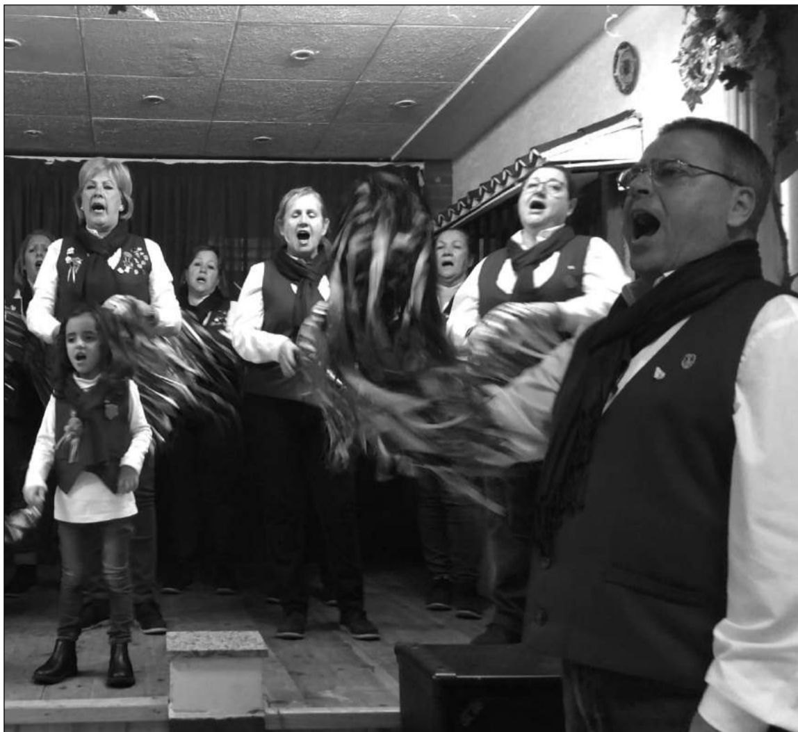
Componentes de la pastoral de la entidad.