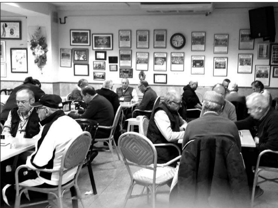
Jugadores de Dominó en la sede del Centro Cultural Renfe.