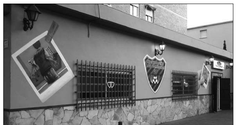
Exterior de la sede.

Además, los jugadores de sus equipos de fútbol sala ya disponen de las nuevas equipaciones de esta temporada.