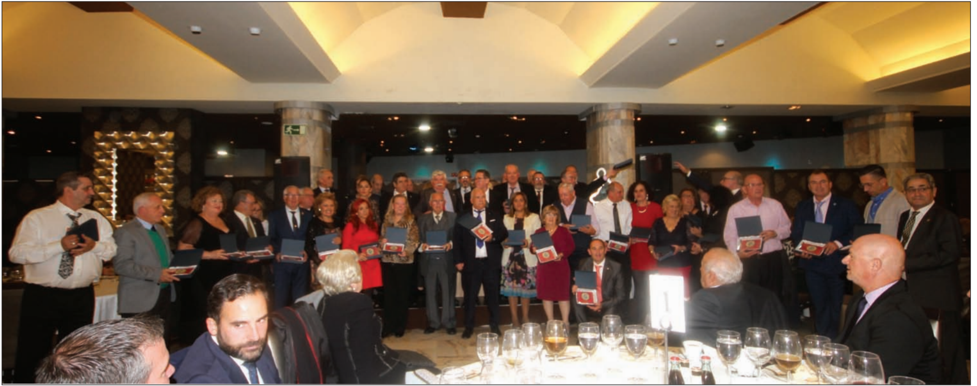
Componentes de las entidades asistentes recogen un recuerdo del Aniversario.

nuestro colectivo, cohesionado en sus peñas y que siente el respaldo de las instituciones y empresas privadas que sigue creyendo en nuestro proyecto y en la función que desempeñamos en la sociedad malagueña”.