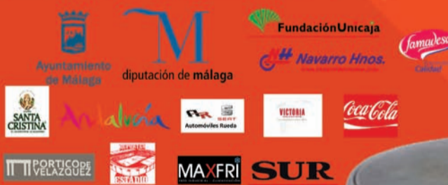
Cartel de la Gala.

Entidades colaboradoras con esta publicación: