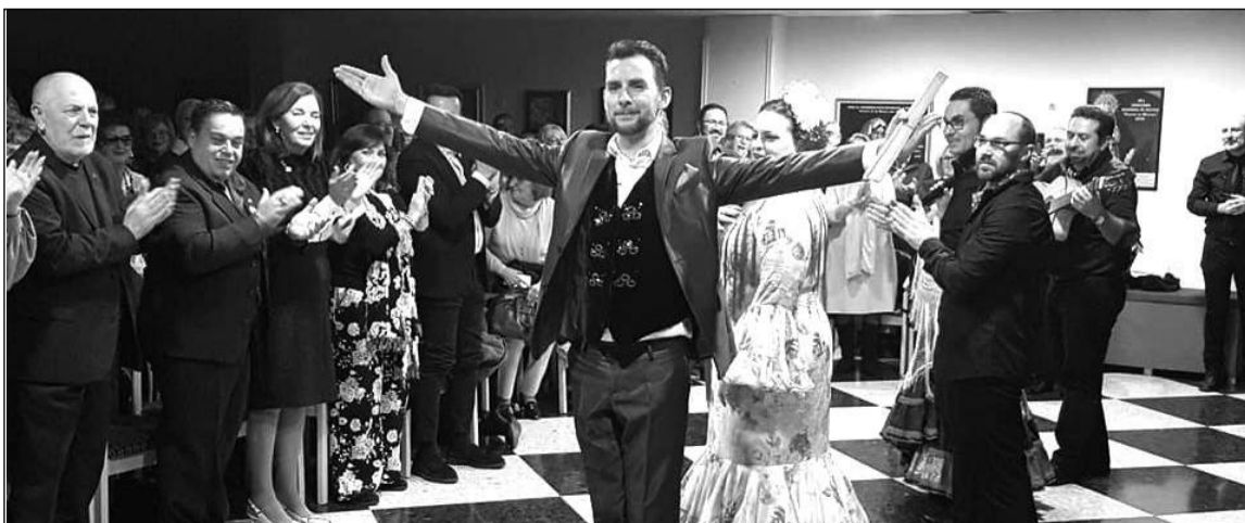
Cierre del espectáculo, con el público en pie.

Por otra parte, el 28 de noviembre se celebraba un nuevo Puchero del Arte, con los grupos de teatro y baile de la entidad, así como la Escuela de Música Cemma.