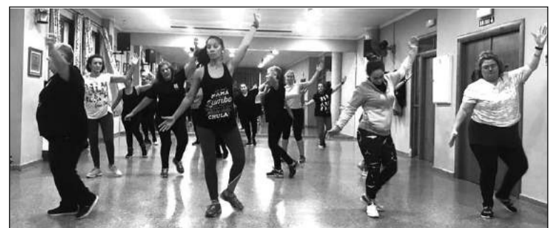
Ensayo para las cabalgatas.

El Grupo de Zumba de la Peña Finca La Palma está realizando los ensayos para las cabalgatas y pasacalles en los que va a participar estas fiestas, concretamente el 21 de diciembre en Teatinos, el 3 de enero en el Puerto de la Torre, y en Colonia Santa Inés día 4 de enero.