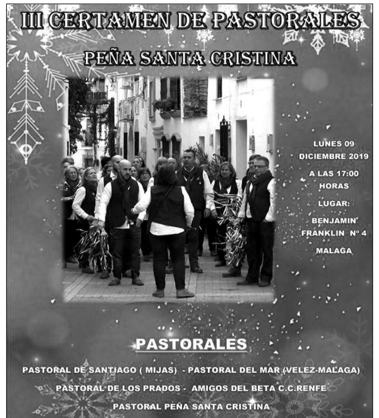
Cartel del certamen.