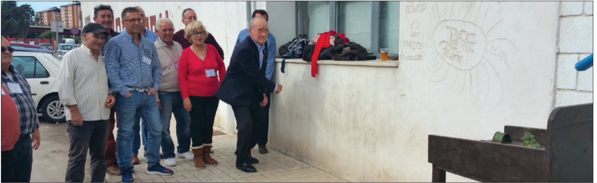
El alcalde probó su puntería en el tiro a la Rana, en el exterior de la sede.