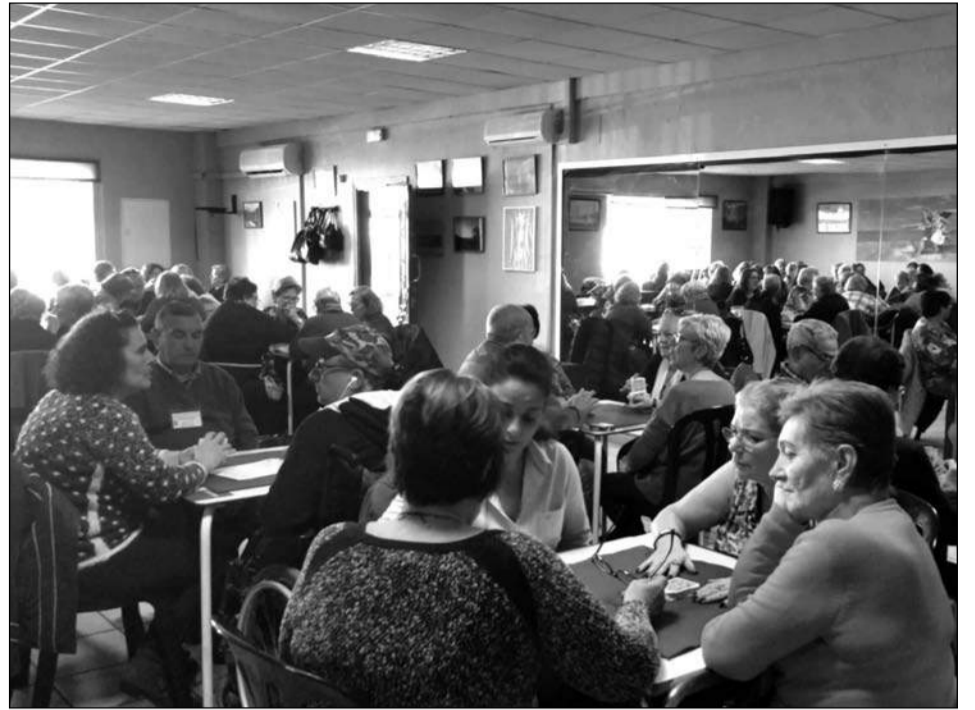
Partidas de Chinchón.