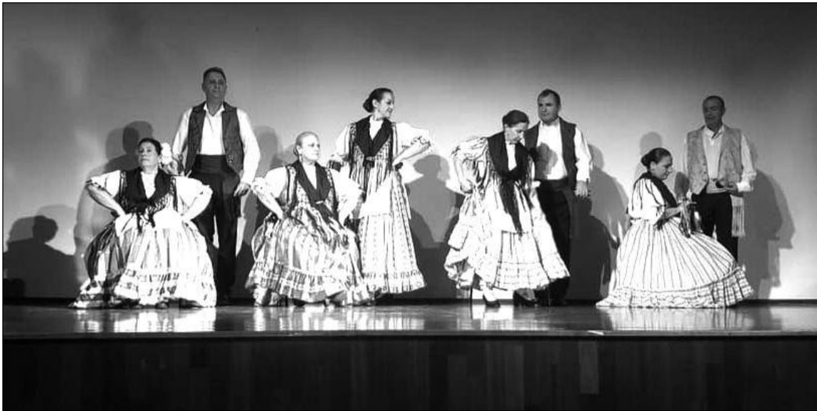
Actuación el pasado sábado en el Centro Cultural de Torremolinos.