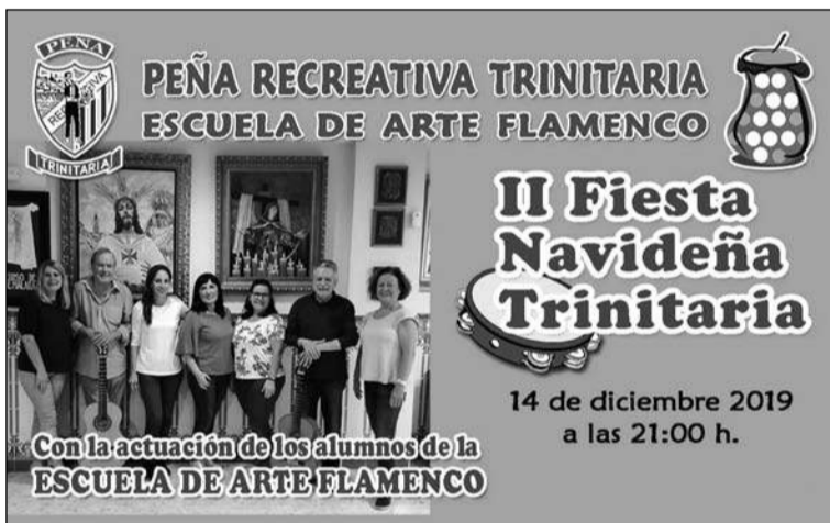
II Fiesta Navideña Trinitaria.