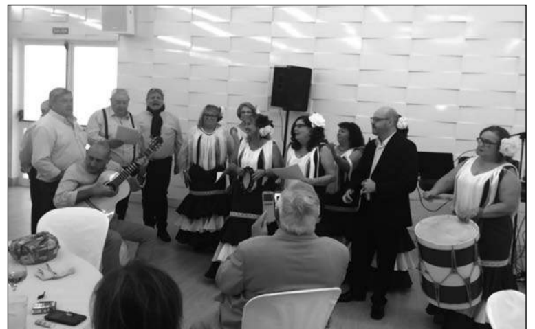
Actuación del coro.