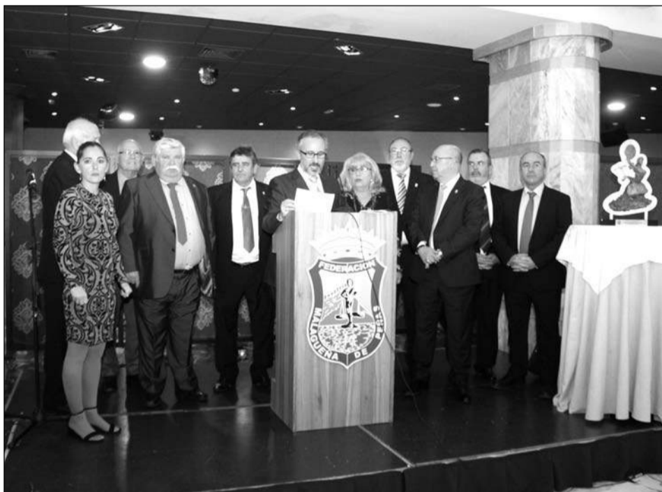
Los directivos de la Federación hicieron entrega de un recuerdo a todas las entidades asistentes.