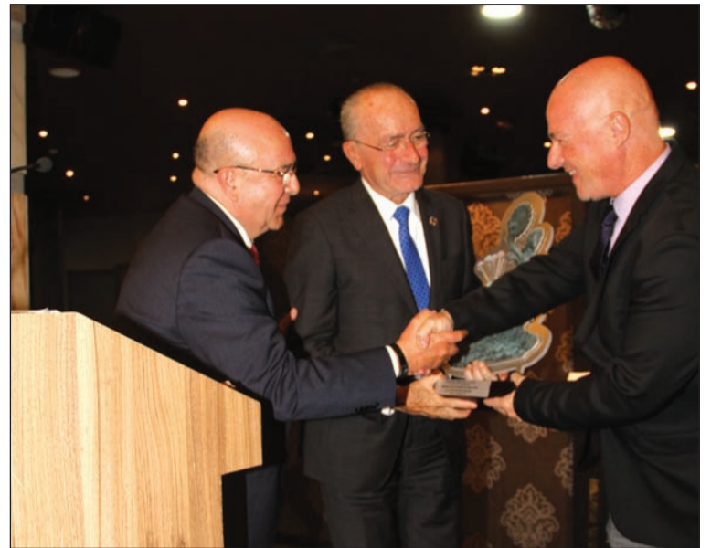
Entrega del premio.