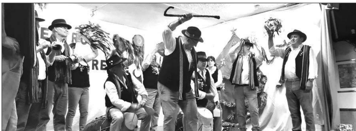
Actuación de la pastoral de la entidad.