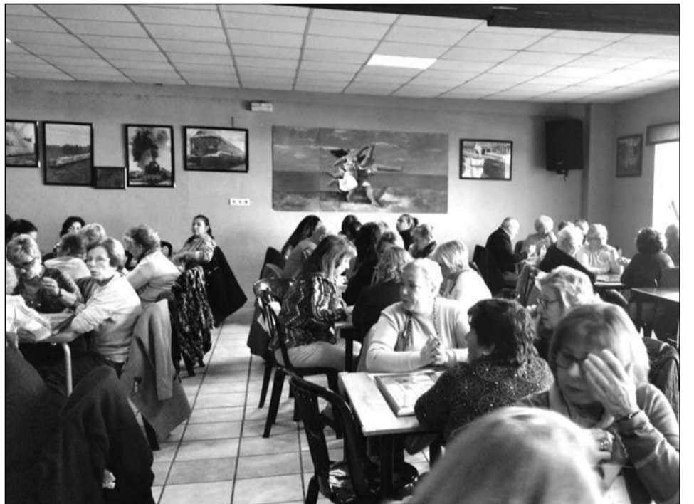
Participantes en la categoría de Parchís.