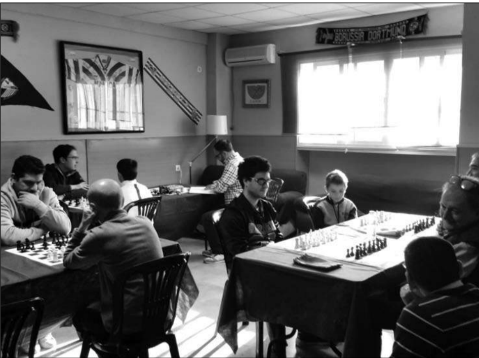
Numerosos jóvenes participaron en la competición de Ajedrez.