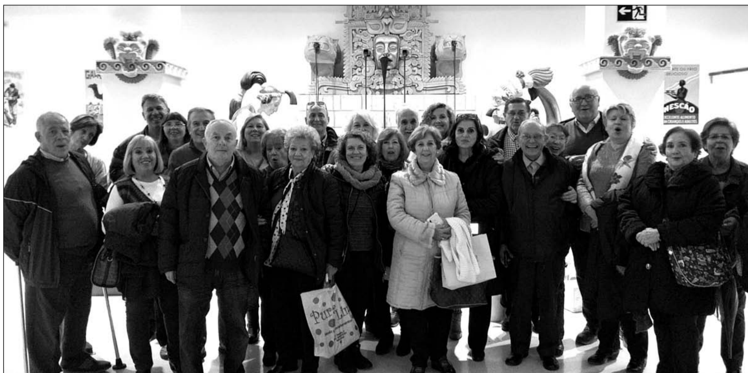
Imagen del grupo en un museo de dulces navideños en Estepa.