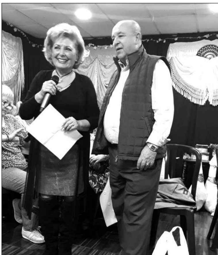
El presidente Manuel Curtido quiso saludar a las mujeres participantes.

pararon igualmente sorteos de diferentes productos como gentileza hacia las asistentes.