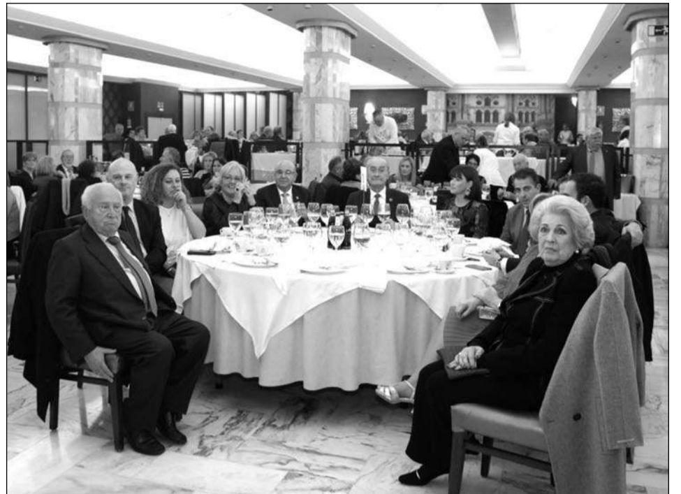
Miembros de la mesa presidencial, durante el acto protocolario.