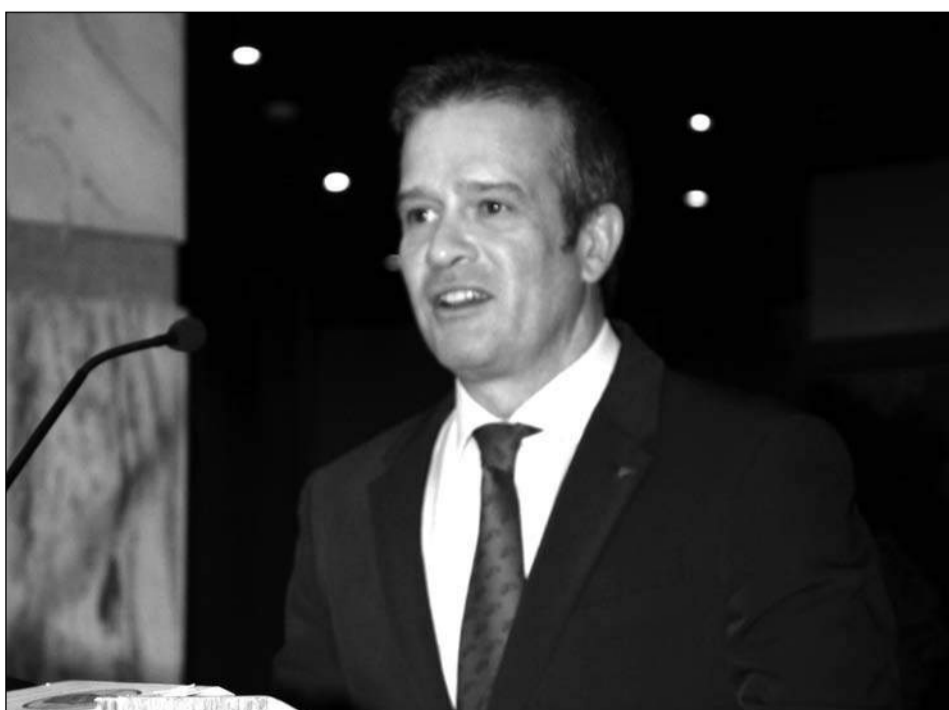
Intervención del diputado de Cultura, Víctor González.