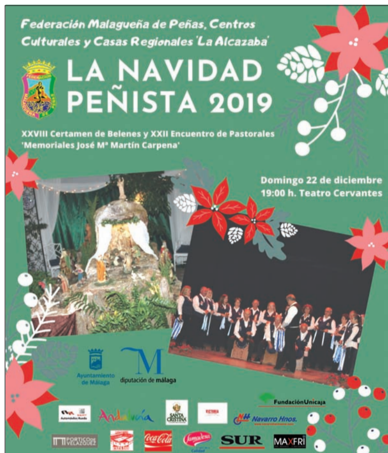
Cartel de la Navidad Peñista 2019.

El plazo de inscripción terminará el día 9 de diciembre a las 13:00 horas, en las oficinas de la Federación de Peñas. Posteriormente, el miércoles 11 a las 20 horas se celebrará una reunión de coordinación en la sede del colectivo.