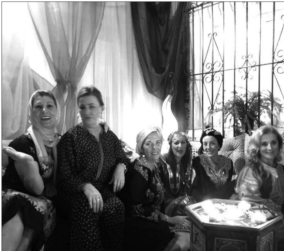
Socias disfrutando de esta fiesta temática.