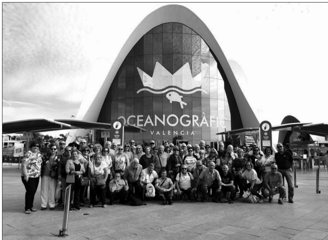
Socios ante el Oceanogràfic de Valencia.