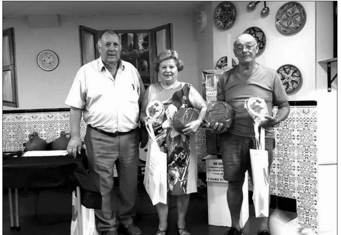
Entrega de trofeos.

Todos los participantes compartieron el almuerzo en una jornada que resultó todo un éxito.