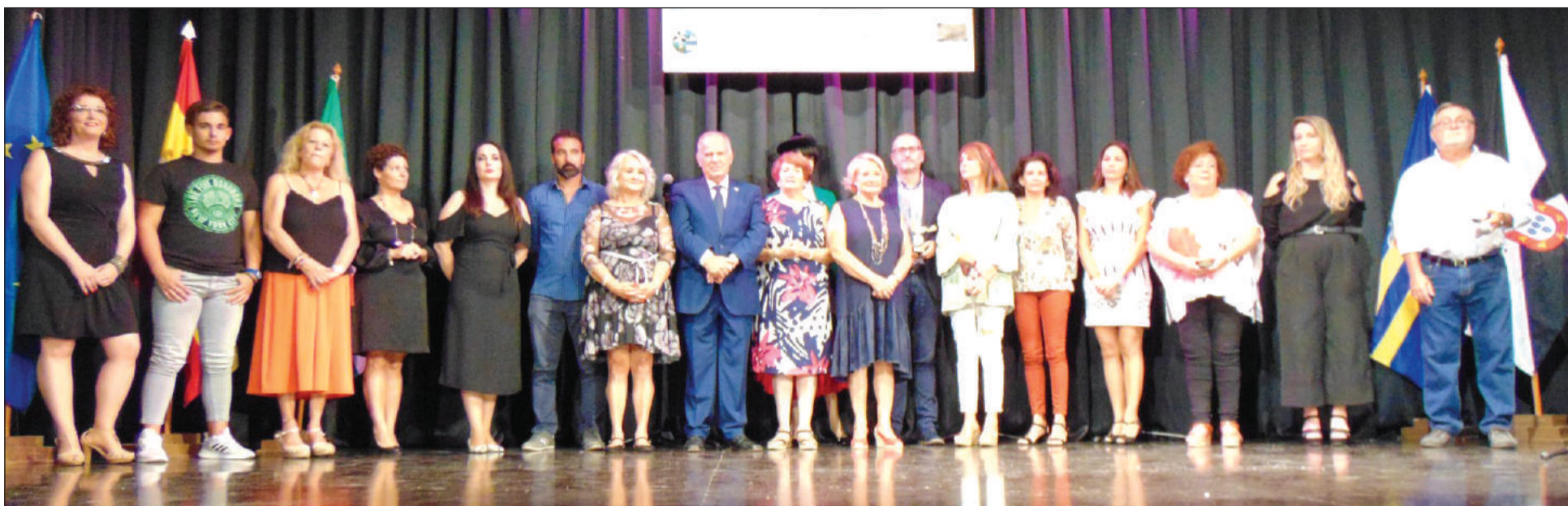
Imagen del acto celebrado en el Centro Cultural Vicente Aleixandre de Alhaurín de la Torre.