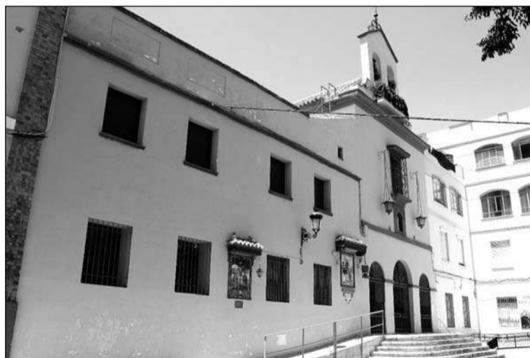
Parroquia de la Divina Pastora, donde comenzará la Caminata.

Desde la Asociación Victoriana de Capuchinos se ha querido recabar la colaboración de numerosos colectivos como la propia Federación Malagueña de Peñas o diversas entidades federadas, además de otros colectivos muy diversos.