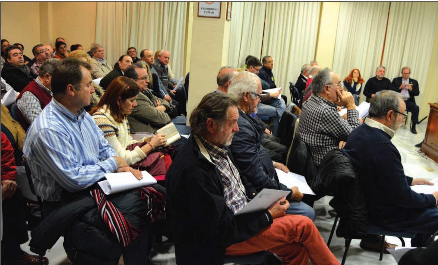
Imagen de archivo de una asamblea general de la Federación Malagueña de Peñas.

Igualmente, se comunica a todas las que no se podrá ejercer el voto en caso de falta de pago de cuotas durante más de tres meses a la fecha de la Asamblea General Extraordinaria. Dado la importancia de los temas a tratar, se solicita a todas las entidades su asistencia a la convocatoria.