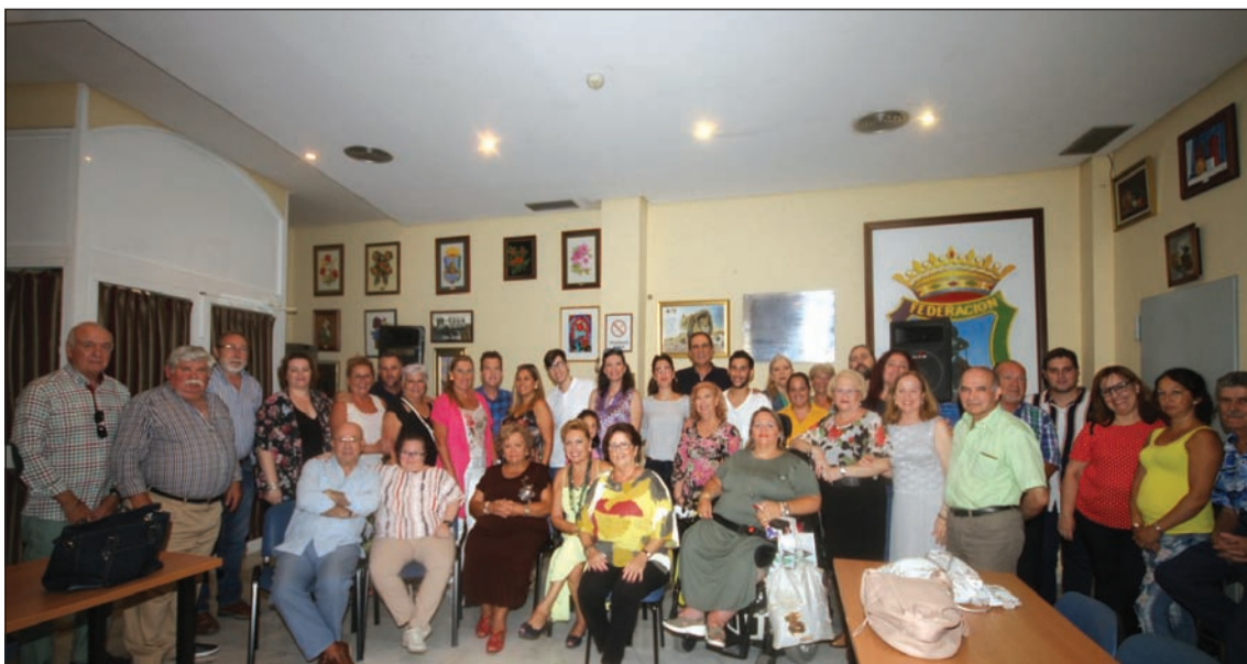
Profesores, directivos de la Federación y alumnos durante la inauguración del curso de la Escuela de Copla.

Tras el éxito de FIFMA 2019, la Federación se plantea dar continuidad a este festival que no se celebraba en nuestra capital desde el año 2011.