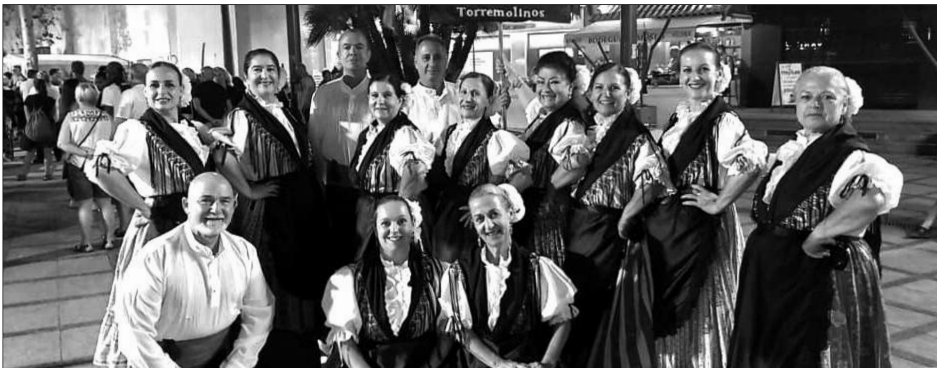
Componentes de la agrupación participaron en el Día de Asturias organizado por el Centro Asturiano en Torremolinos.