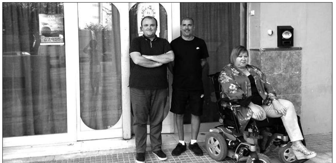
Asistentes a la reunión en el exterior de la sede.