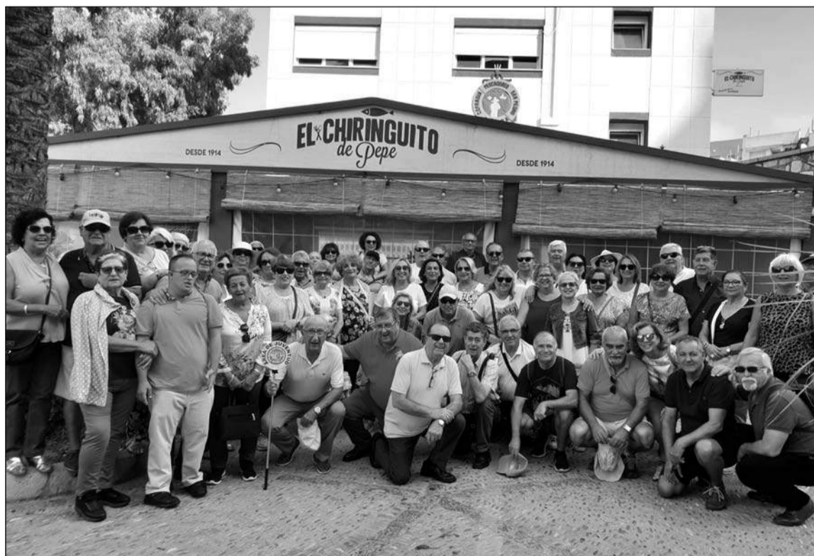
Participantes en este viaje.

Seis días vividos con intensidad y en mejor convivencia.