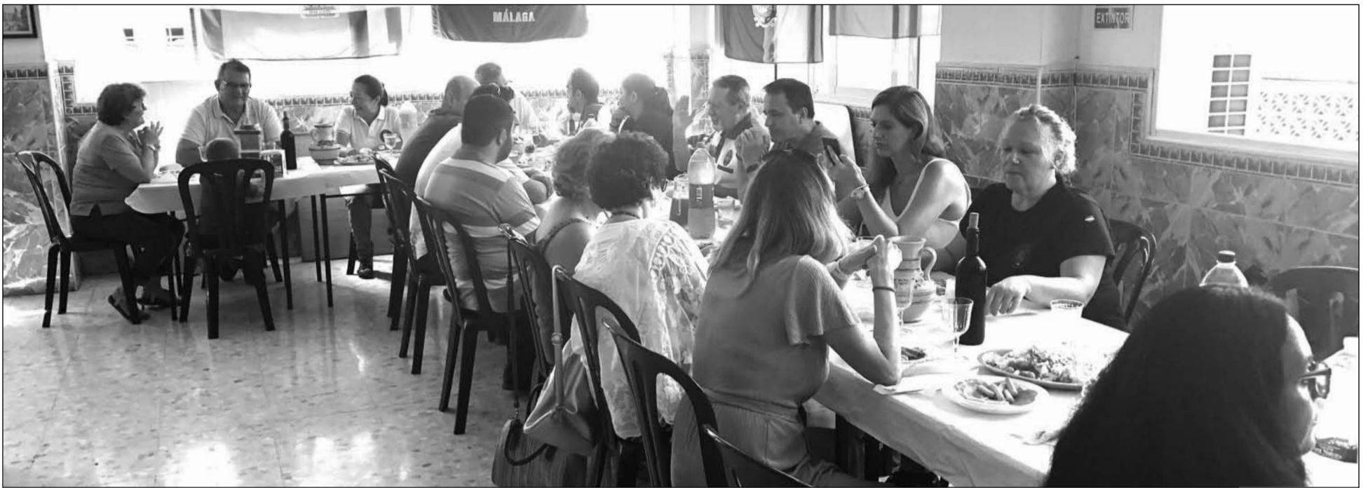
Imagen de los asistentes a esta actividad en el salón de la sede de la Peña Nueva Málaga.