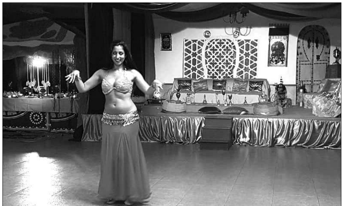
Danza del vientre durante la actividad.