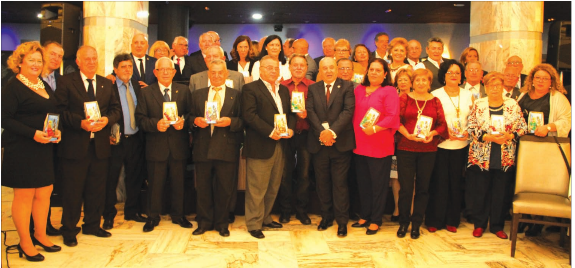
Representantes de las entidades que fueron galardonadas en el aniversario del pasado año con el Premio Malagueño de Pura Cepa.