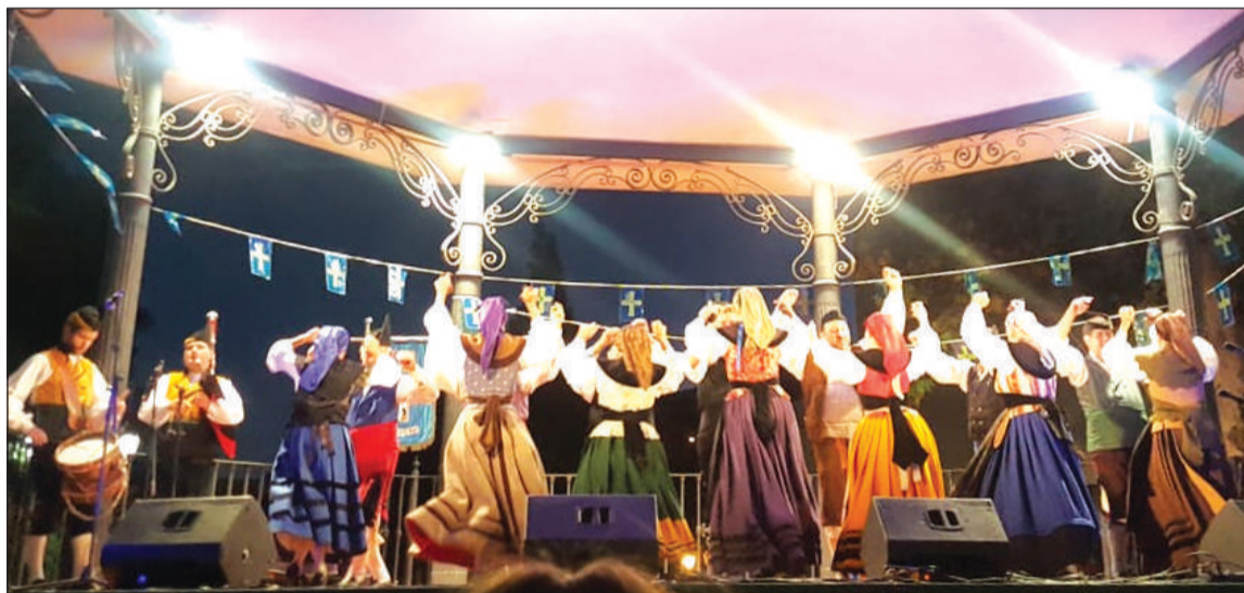
Una de las actuaciones que se han sucedido en la plaza de la Nogalera.

Los festejos del Día de Asturias' concluían el domingo en la sede social del Centro Asturiano con la celebración del Día del Socio con el reparto del 'bollu preñau' y una botella de vino a los socios y la tradicional comida de hermandad de socios y familiares.