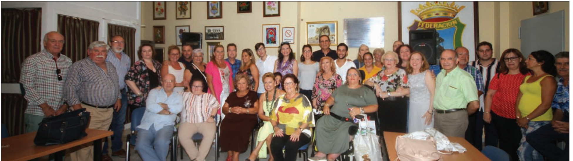
Imagen de grupo con alumnos, profesores y miembros de la directiva de la Federación Malagueña de Peñas.

cio, con entrada por la calle Victoria. Así, ya se ha habilitado un equipo de megafonía para que el desarrollo de las clases.