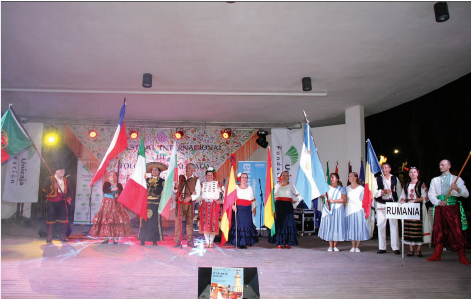
Representantes de los grupos actuantes muestran sus banderas en la apertura del FIFMA 2019.

Número 685 9 de Octubre de 2019 C/ Pedro Molina, 1 Tfno: 952 22 54 39 Fax: 952 21 48 82 E-mail: prensa@femape.com - fmpalcazaba@gmail.com Web: www.femape.com Edición digital: www.femape.com/laalcazabadigital Twitter: @FMPLaAlcazaba Facebook: www.facebook.com/FMPLaAlcazaba