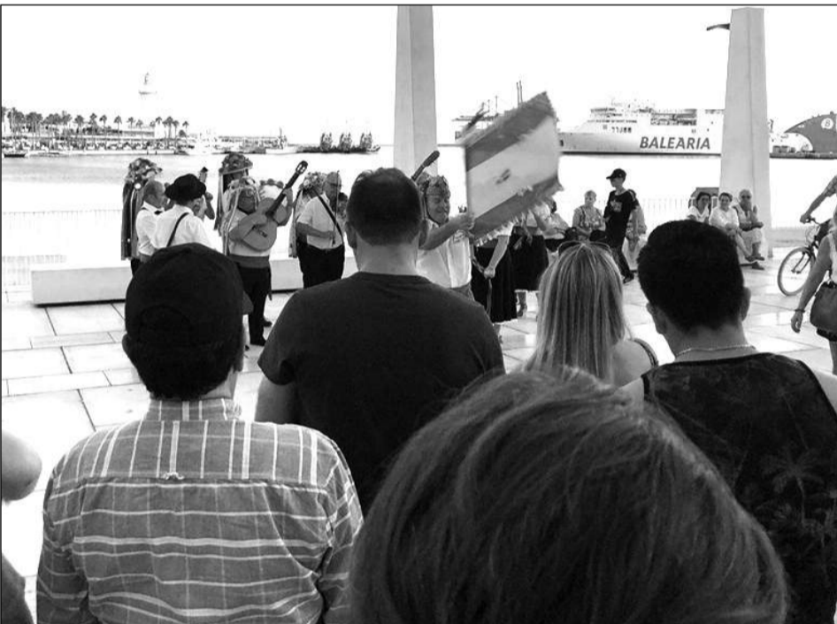
Público disfruta de una actuación en el Puerto antes del pase en el Eduardo Ocón.