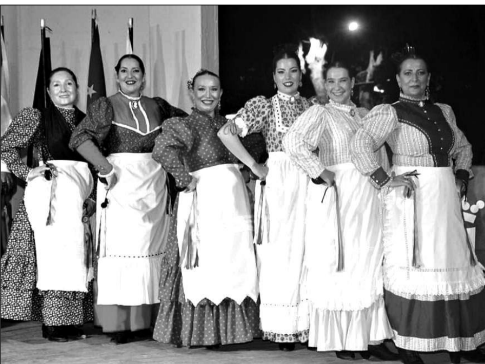
Componentes de la Asociación Folclórico Cultural Juan Navarro.