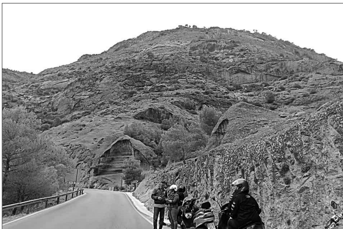
Tras las ruta motera, la entidad propone una nueva actividad al aire libre.

Desde la organización se señala a todos los interesados que deben realizar su inscripción antes del domingo 13 de octubre. Posteriormente no se asegura la entrega de la camiseta.