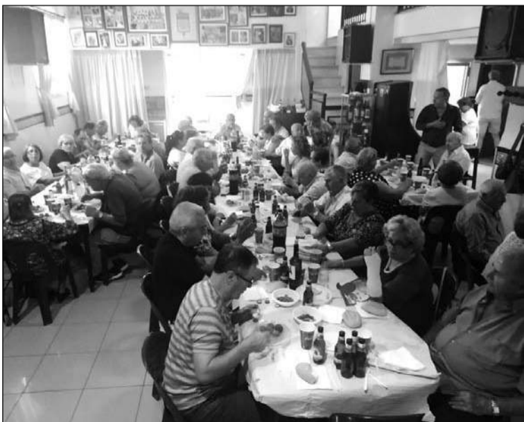
Vista general del salón.

Con tal motivo se preparó un almuerzo que estuvo acompañado de música en vivo en una actividad que contó con una gran afluencia de público y buen ambiente entre todos los asistentes.