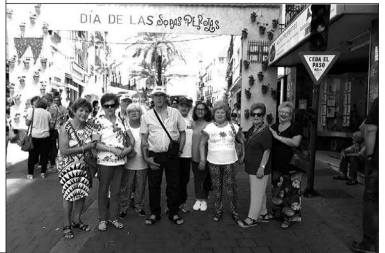
Socios disfrutan del Día de las Sopas Perotas.

Como adelanto a ese mismo mes, el 23 de noviembre ya se anuncia el VIII Concurso de Tortilla de Patatas, que dará inicio a las 19 horas con premios para los tres primeros.