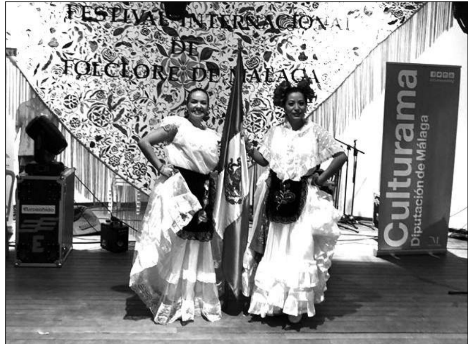
Representantes de México.