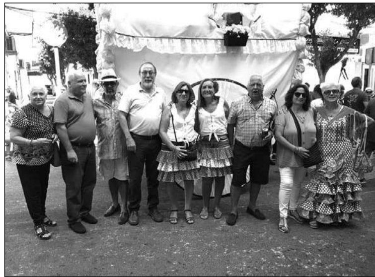
Peñistas en la Romería de San Miguel de Torremolinos.

En las últimas semanas han sido dos las propuestas realizadas, en primer lugar a la popular Romería de San Miguel de Torremolinos; mientras que el pasado fin de semana, junto a la Plataforma Ciudadana Perchel-El Carmen, se trasladaban a tierras jiennenses para disfrutar de una recreación histórica de la Batalla de Bailén.