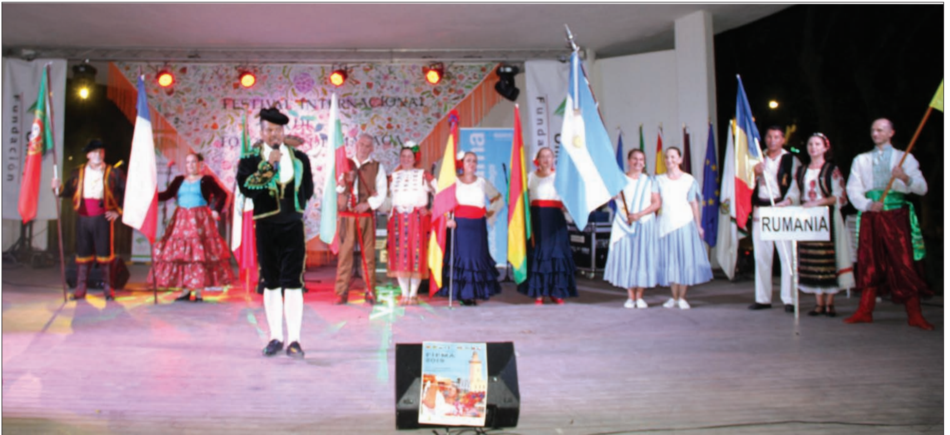
Participantes en la presentación del festival.