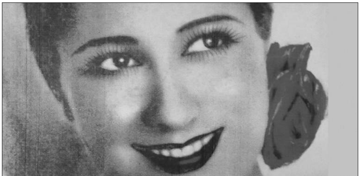
Imagen empleada por la Peña La Paz para anunciar las fechas de su XXV edición del Certamen de Copla.

La gran final, como es tradicional, volverá a celebrarse en el Teatro Cervantes en la jornada del 10 de diciembre.