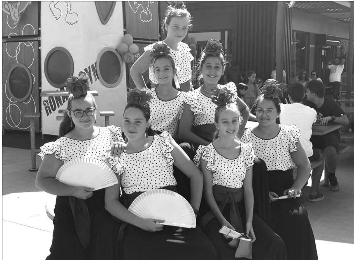
Componentes de un grupo de baile flamenco de la asociación.

De cara a fechas próximas, y tras el éxito del viaje cultural que realizaron los socios durante los meses pasados, se propone a sus asociados otro nuevo viaje. En esta ocasión será más cercano, con carácter vacacional, a la localidad malagueña de Torrox. Allí se alojarán en un establecimiento hotelero durante los días 8, 9 y 10 de noviembre en régimen de todo incluido.