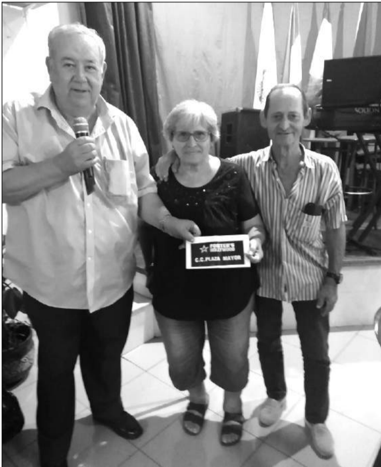
Se entregaron premios y distinciones.