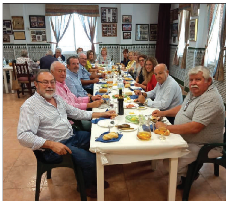
Directivos de la Peña Perchelera y la Federación de Peñas.