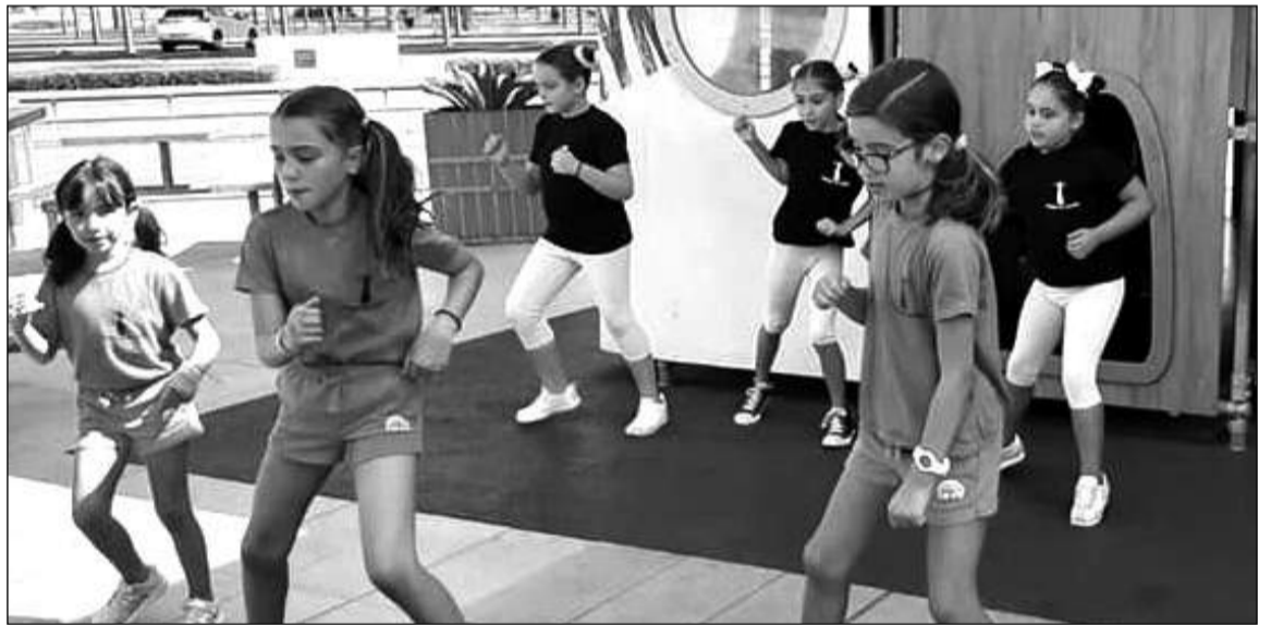
Exhibición de las pequeñas con uno de sus bailes.