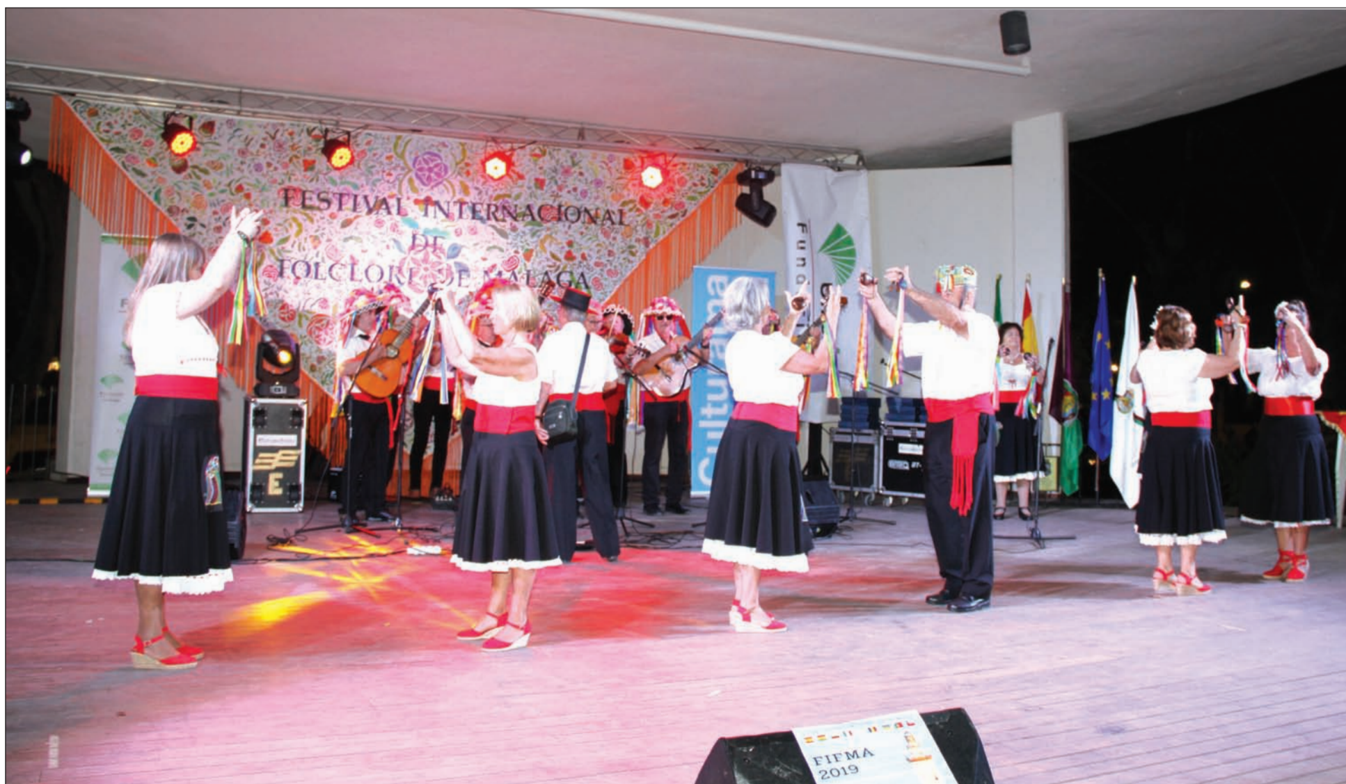
El folclore local también ha estado ampliamente representado en FIFMA 2019.