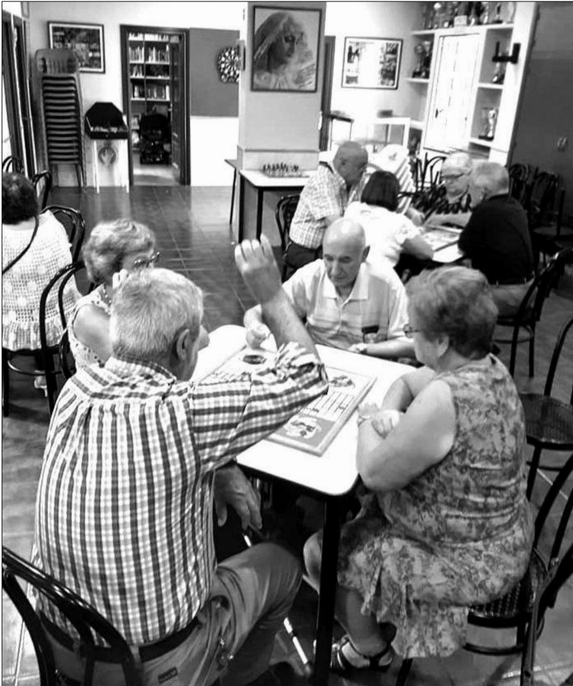
Vista del salón durante la disputa del torneo.