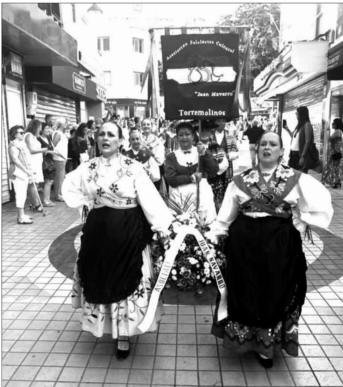
Integrantes de la asociación se dirigen a hacer la ofrenda floral.