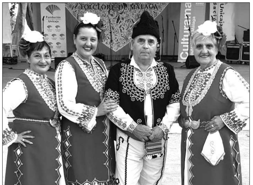
Los grupos internacionales lucieron sus vestuarios típicos.