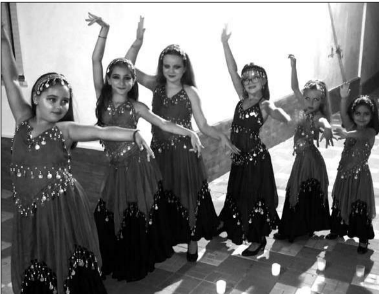
Actuación en la Fiesta Sueños Colonos.