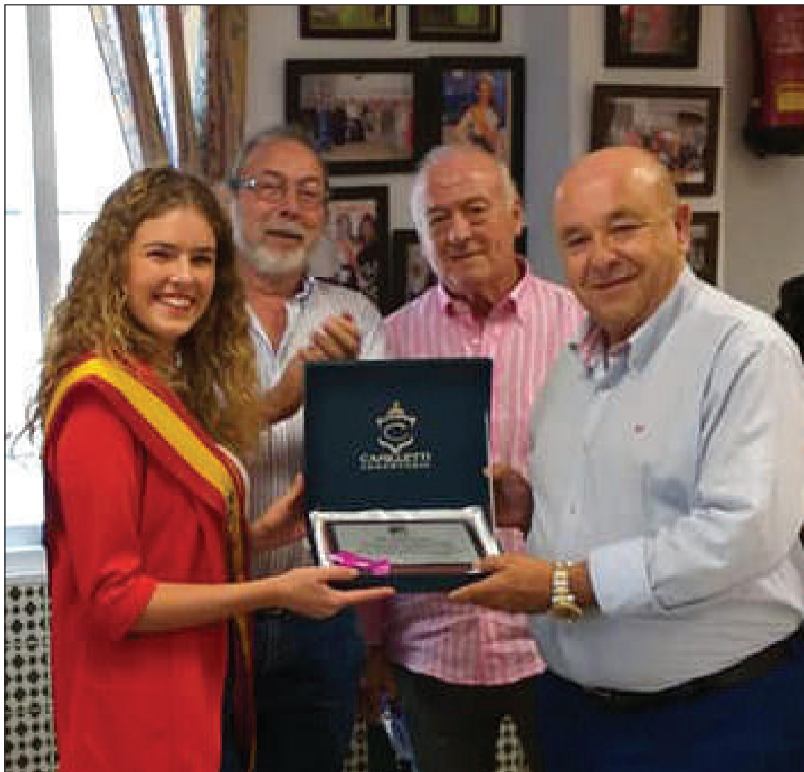
La Reina de la Feria es también reina de la Peña Perchelera, a la que acompañó.