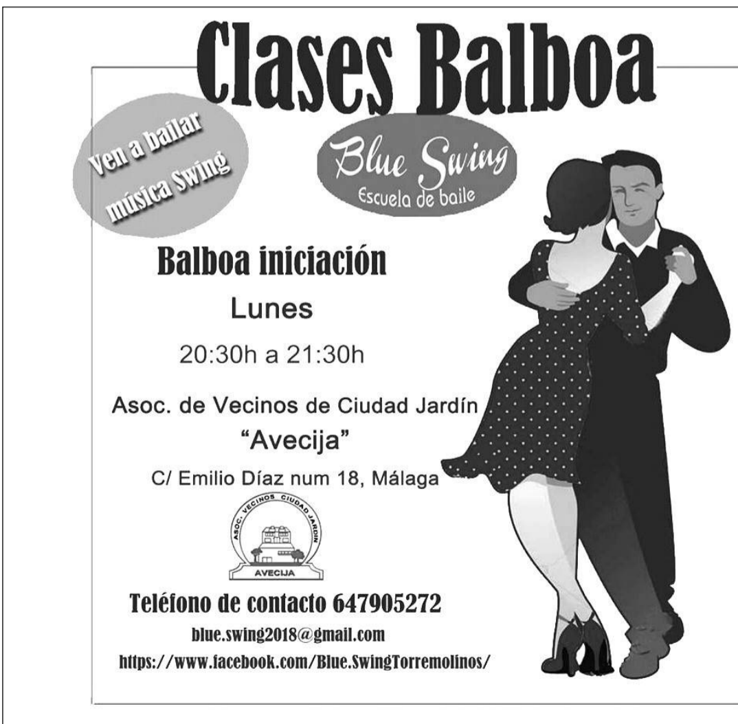
Cartel de la actividad.