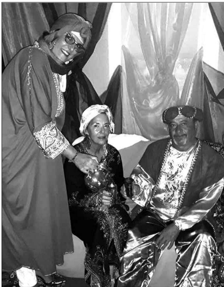
Disfrutando del té moruno.