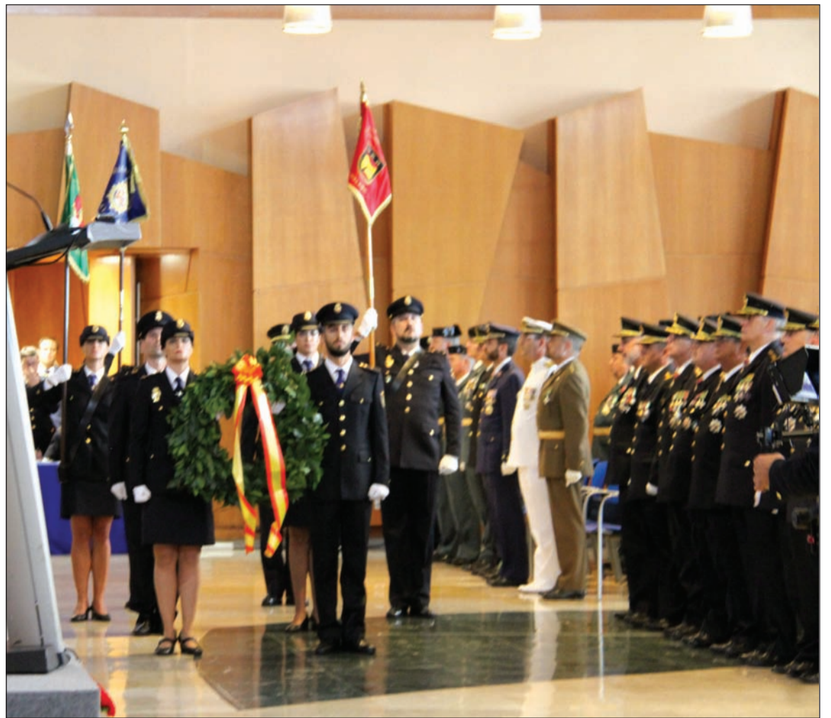
Acto de homenaje a los Caídos de la Policía Nacional.