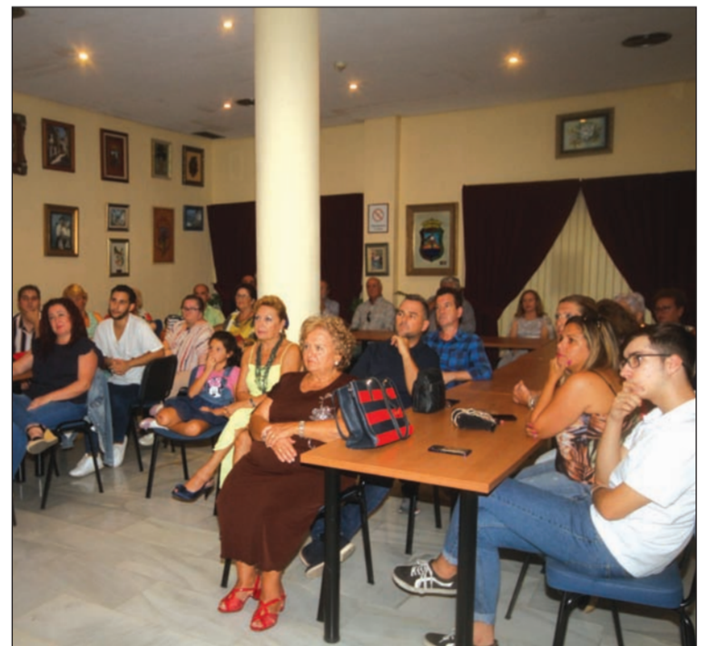
Alumnos atentos a las explicaciones en la primera clase.