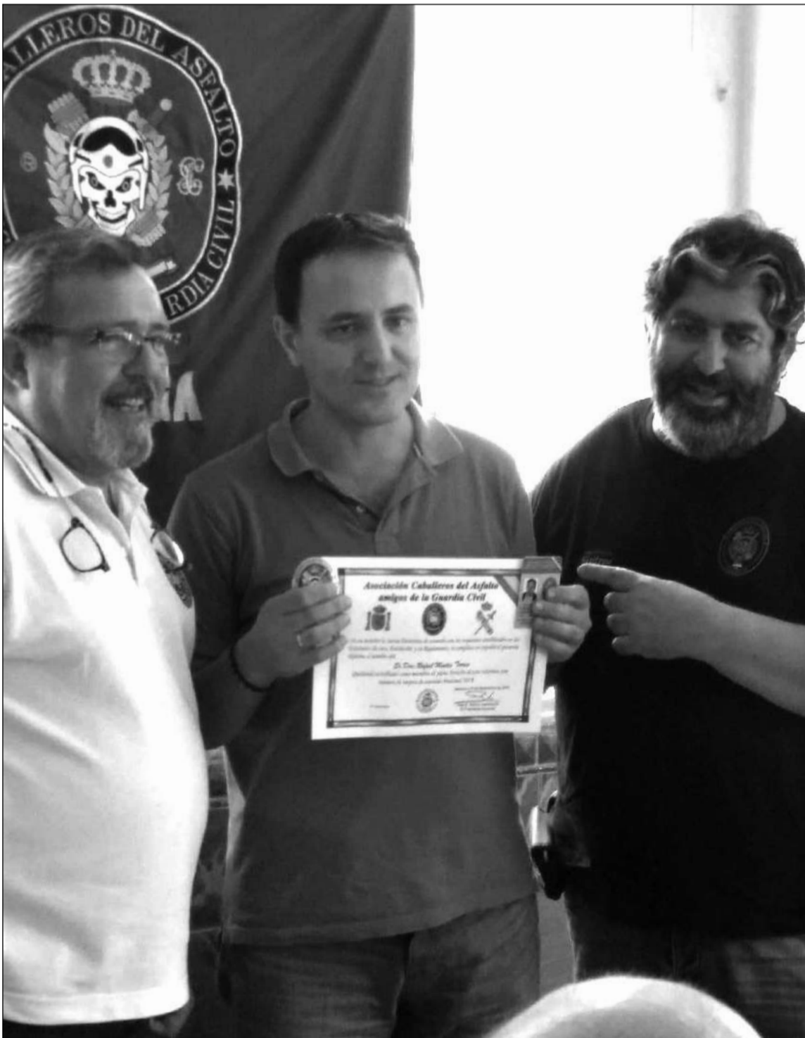
Entrega de un diploma al nuevo miembro.