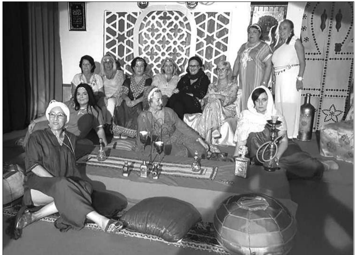
Imagen de grupo de mujeres en la fiesta.

En otro orden de cosas, El Vagón del Teatro, el grupo del Centro Cultural Renfe, va a ofrecer el próximo 16 de octubre una jornada a beneficio de los Ángeles Malagueños de la Noche. Así, actuarán a partir de las 17:30 horas junto al grupo Fepma-Utopía en el Auditorio Edgar Neville de la Diputación de Málaga.