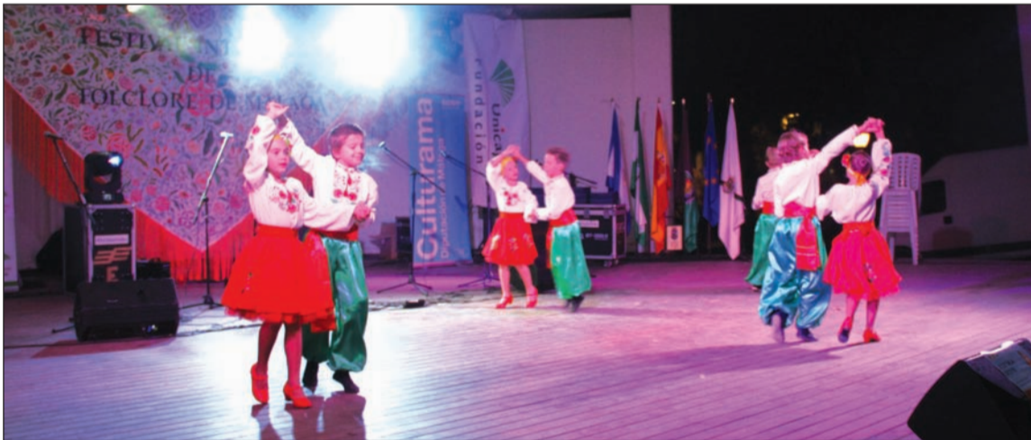
Uno de los grupos, en este caso infantil.