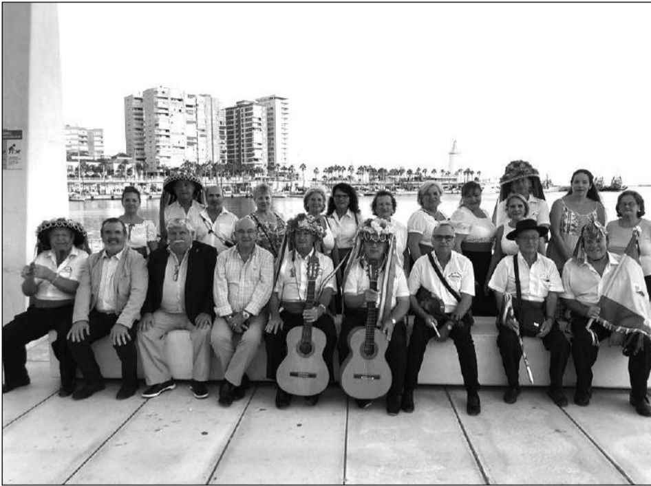
Miembros de la junta directiva con la panda de verdiales.