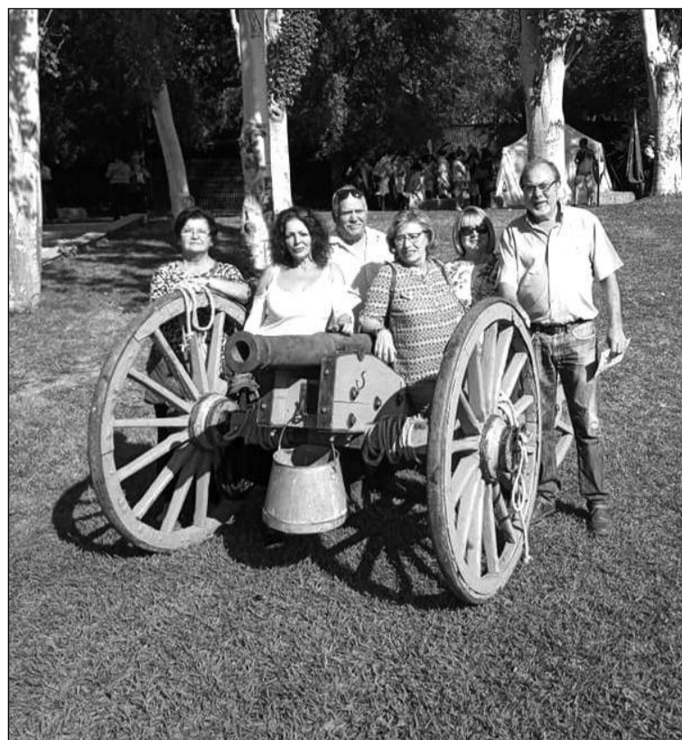
Socios en Bailén.