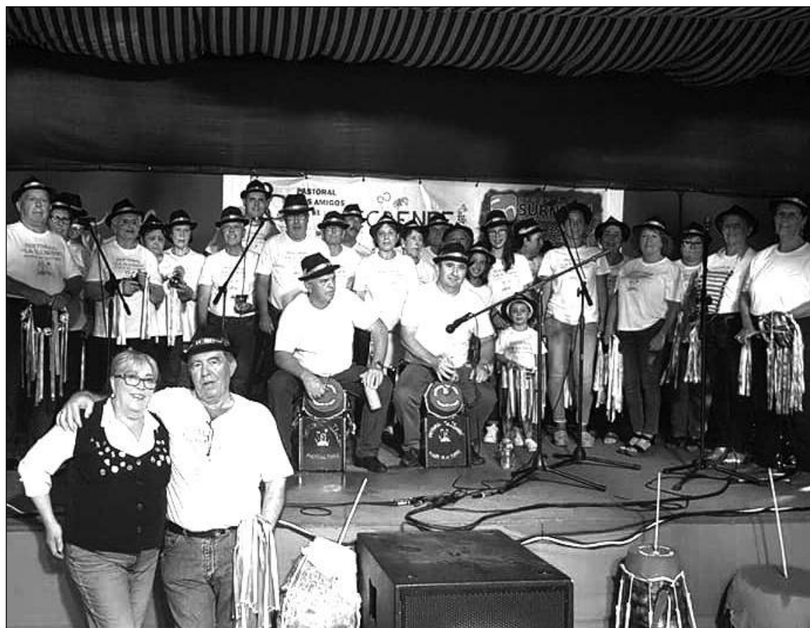
Imagen del encuentro de pastorales.

Cultural Renfe. La décima edición de su certamen dedicado a este género musical ha sido uno de los acontecimientos destacados durante los días de fiesta en