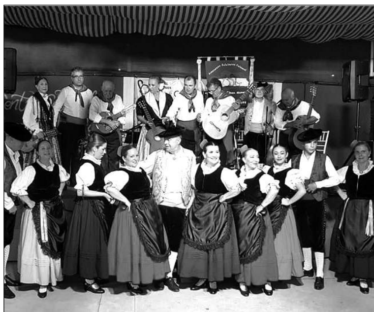
Integrantes de la Asociación Juan Navarro.

La Feria se ha vivido, un año más, al son de las Malagueñas de Fiesta en la caseta del Centro