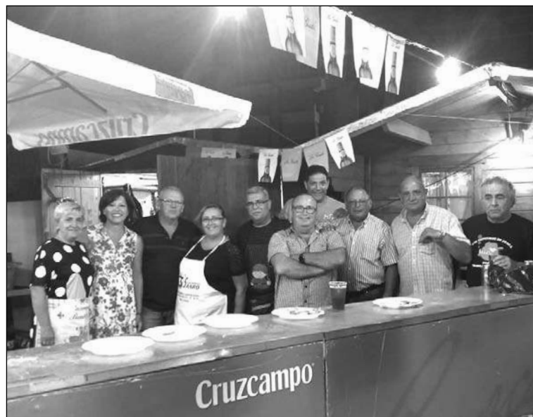
Socios encargados de la organización de la fiesta.

Una vez concluida la Feria, el viernes 30 de agosto, se organizaba una nueva actividad por parte de la Peña Colonia Santa Inés, contándose con cante flamenco.