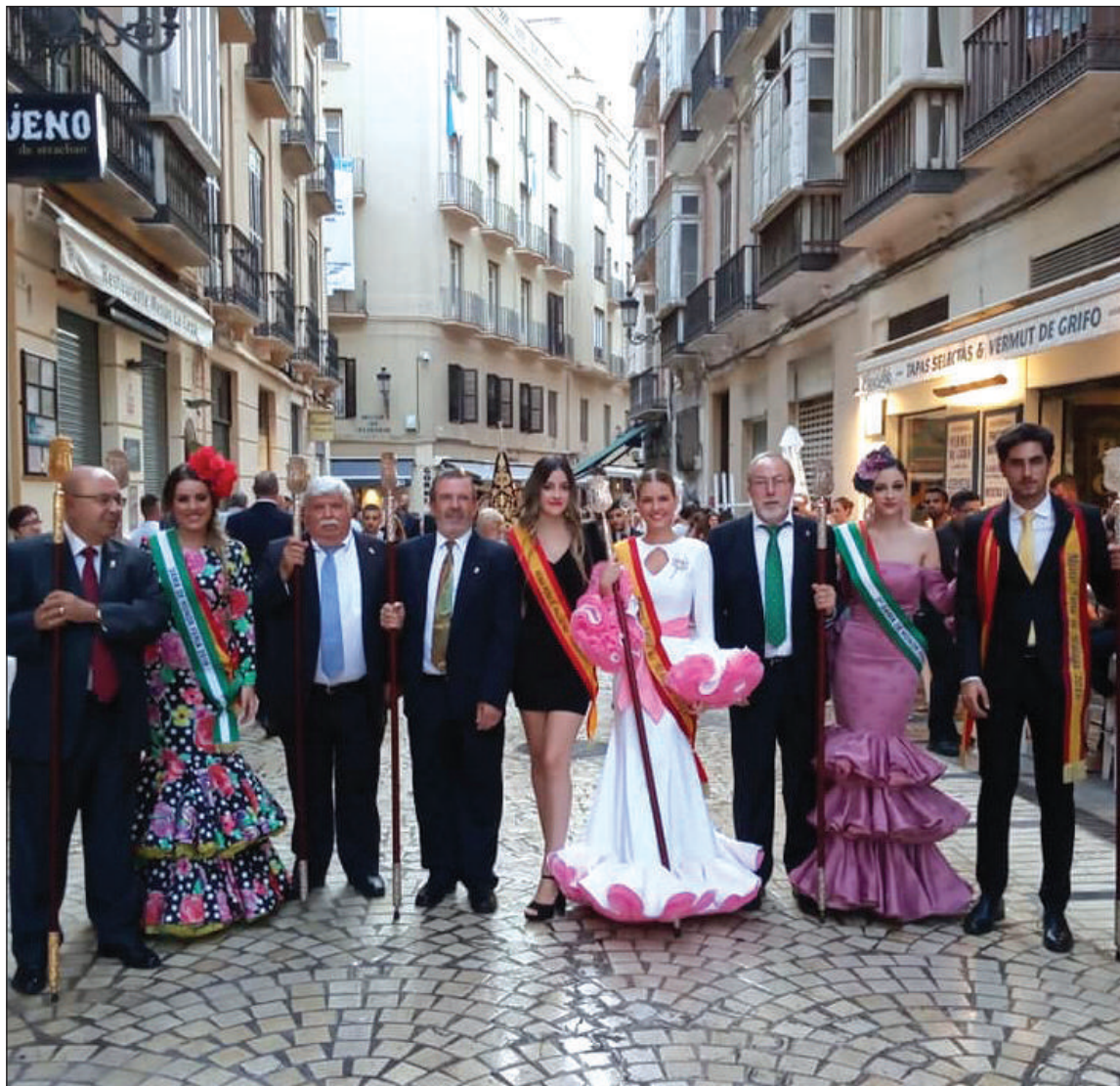
Representación peñista en la procesión.