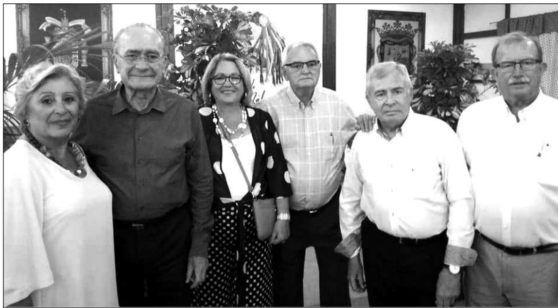
El alcalde acudió el sábado 24 a la caseta de la entidad.