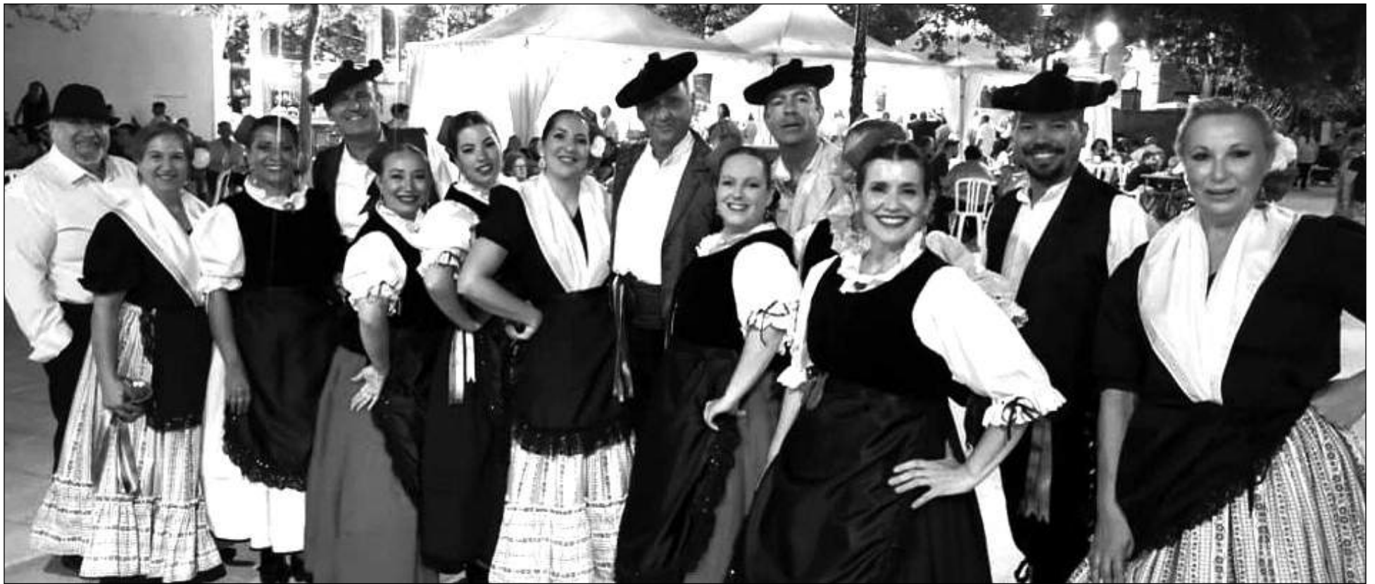
Miembros de la asociación en la Feria de Campillos.