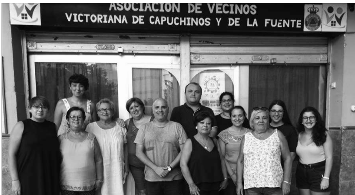
Monitores de los talleres junto a la delegada de formación y el presidente.

Por otra parte, la Asociación estaba representada el pasado domingo 8 de septiembre en la procesión de la Patrona de Málaga, Santa María de la Victoria, en la que inauguraron su bandera.