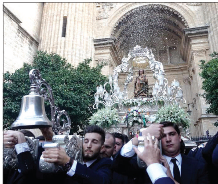
A la izquierda, miembros de la junta directiva con representantes de la hermandad, las reinas y los misters ante la Virgen de la Victoria. A la derecha, salida procesional de la Patrona desde la Catedral.