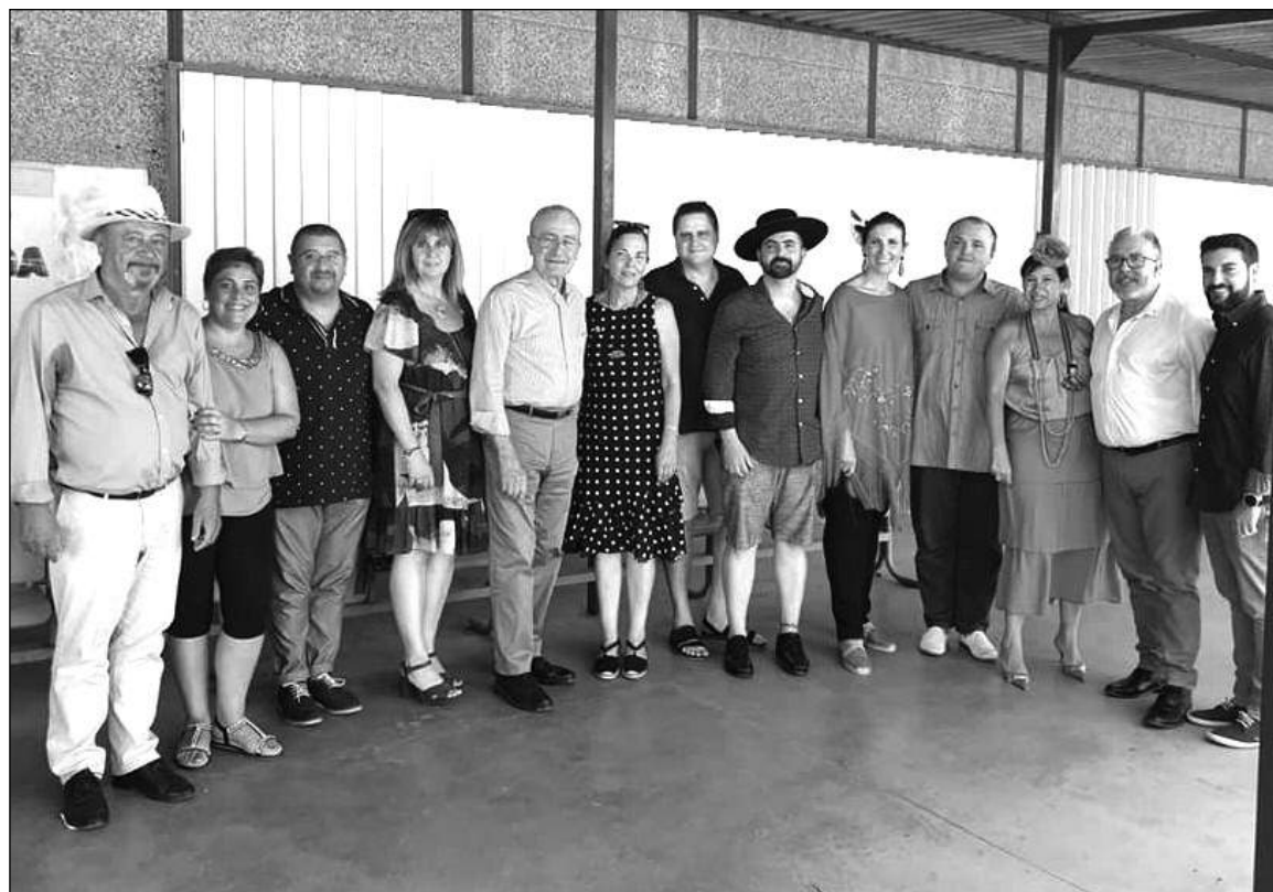
Visita del alcalde y otras autoridades a la caseta de la Peña La Biznaga.

Por otra parte, desde esta entidad perteneciente a la Federación Malagueña de Peñas, Centros Culturales y Casas Regionales 'La Alcazaba' se está trabajando en el XLV Aniversario, que celebrarán el 21 de septiembre.