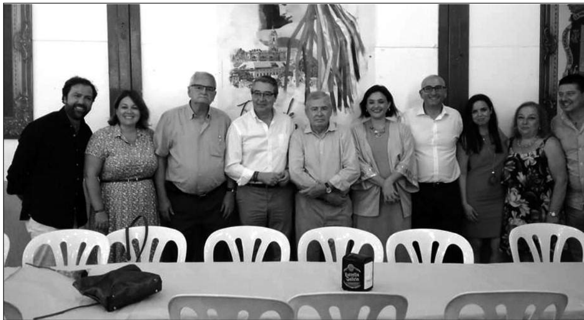
Visita de representantes de la Diputación, con su presidente Francisco Salado al frente.