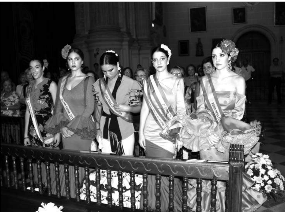
Damas de Honor de la Reina de la Feria de Málaga.