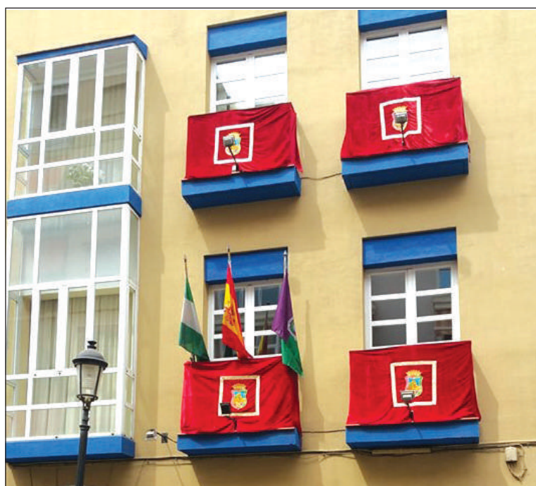
Sede de la Federación engalanada.