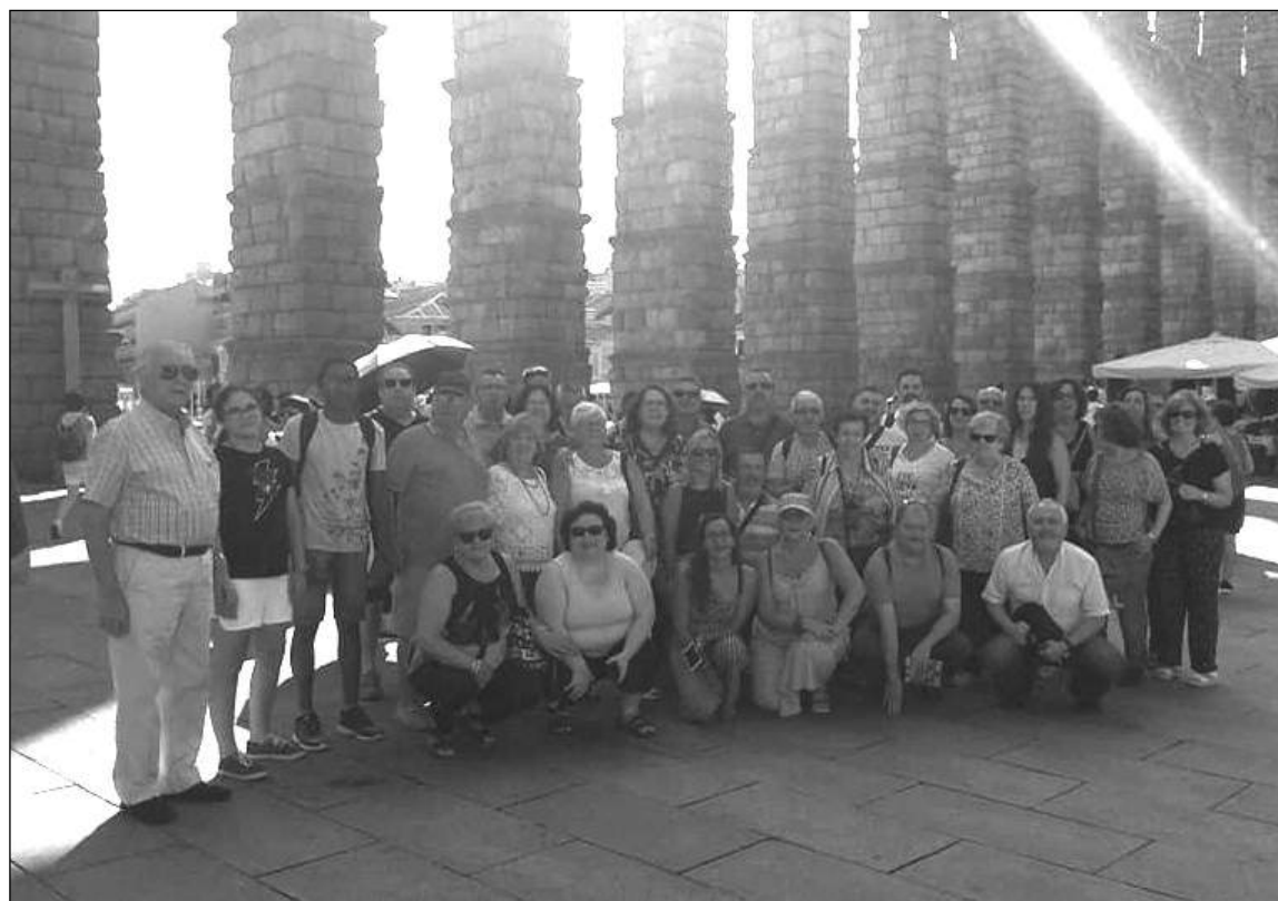
Miembros de la asociación bajo el Acueducto de Segovia.

sión de descubrir Zamora, Ciudad Rodrigo o Segovia. La Granja de San Ildefonso, Medina de Rioseco, Ávila o Valladolid han sido otros de