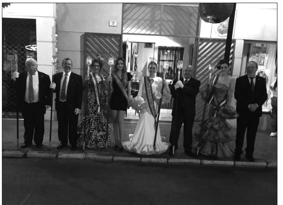
Representación peñista en la procesión a su llegada a la sede de la Federación.