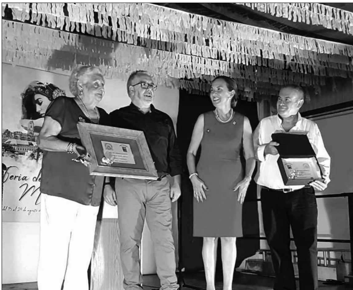
Hermanamiento de Avecija y la Peña El Sombrero.

La Feria de Málaga 2019 no será fácil de olvidar para una entidad perteneciente a la Federación Malagueña de Peñas, Centros Culturales y Casas Regiona-