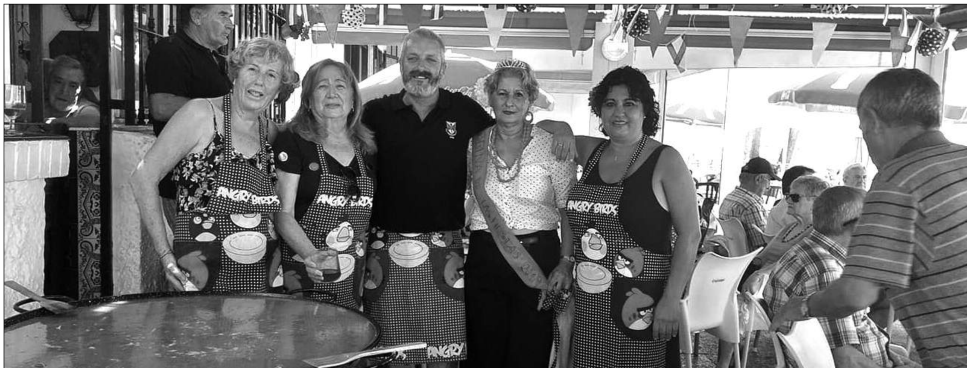
Socios disfrutando de esta actividad en la terraza exterior de la sede de la Peña Recreativa Pedregalejo.

Para el 28 de septiembre se ha programado una excursión a Sevilla, en la que la peña sufragará el viaje y el desayuno para todos los socios.