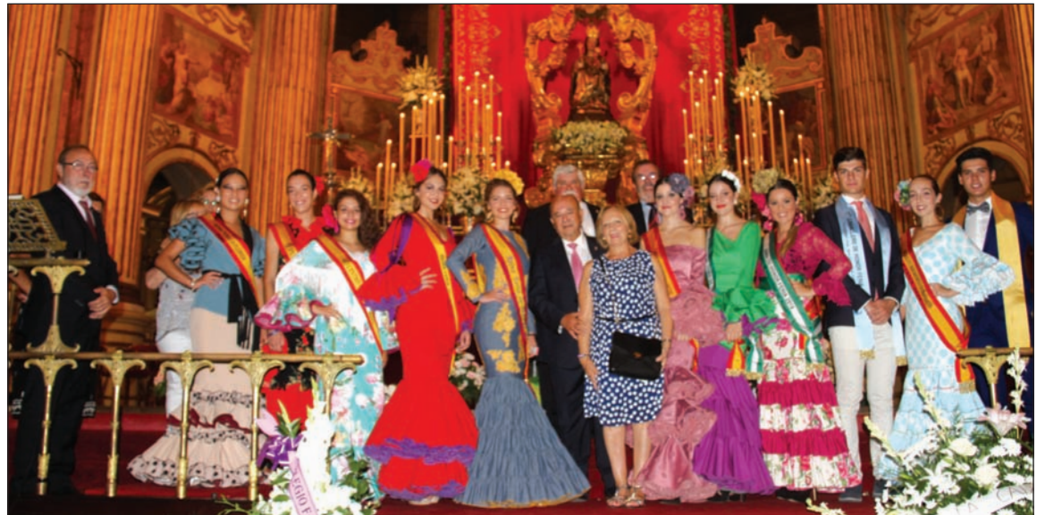
Imagen de grupo ante Santa María de la Victoria.

La sede de la Federación, ubicada en la propia calle de la Victoria, era engalanada para recibir el paso del cortejo como es tradicional.