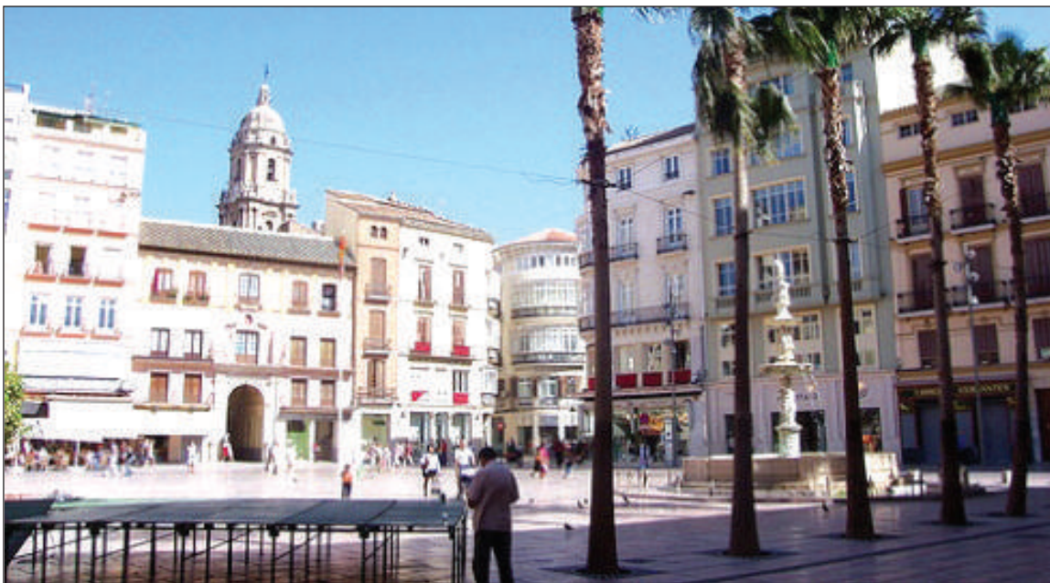
La plaza de la Constitución acogerá la inauguración del 24 de septiembre y las sesiones del 25, 26 y 27.

◆ Federación Malagueña de Peñas, Centros Culturales y Casas Regionales 'La Alcazaba'