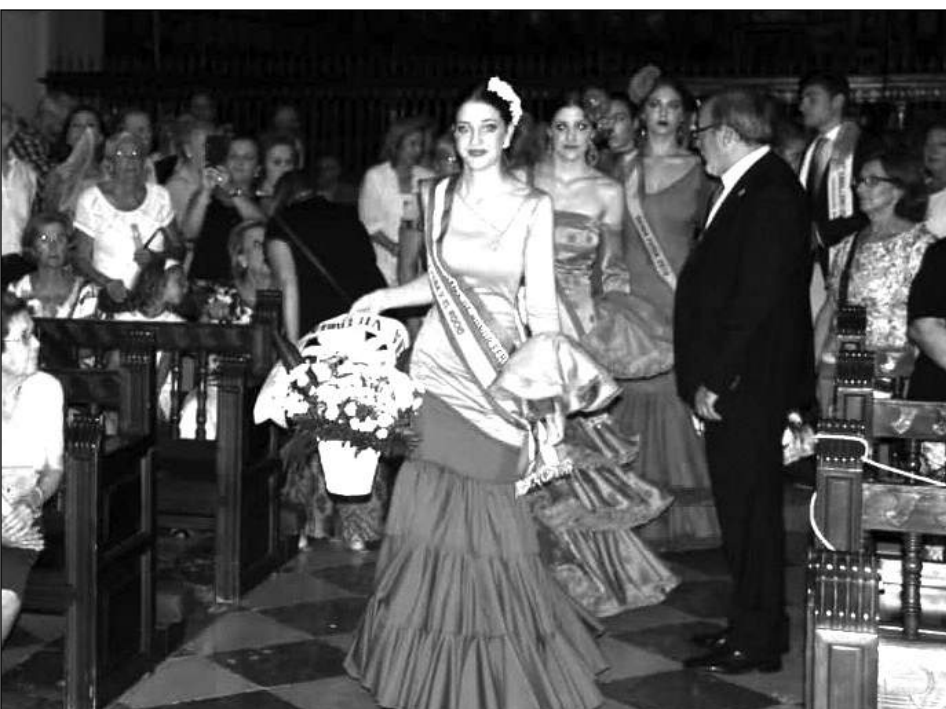
Reinas de las entidades acercan las flores a la Patrona.