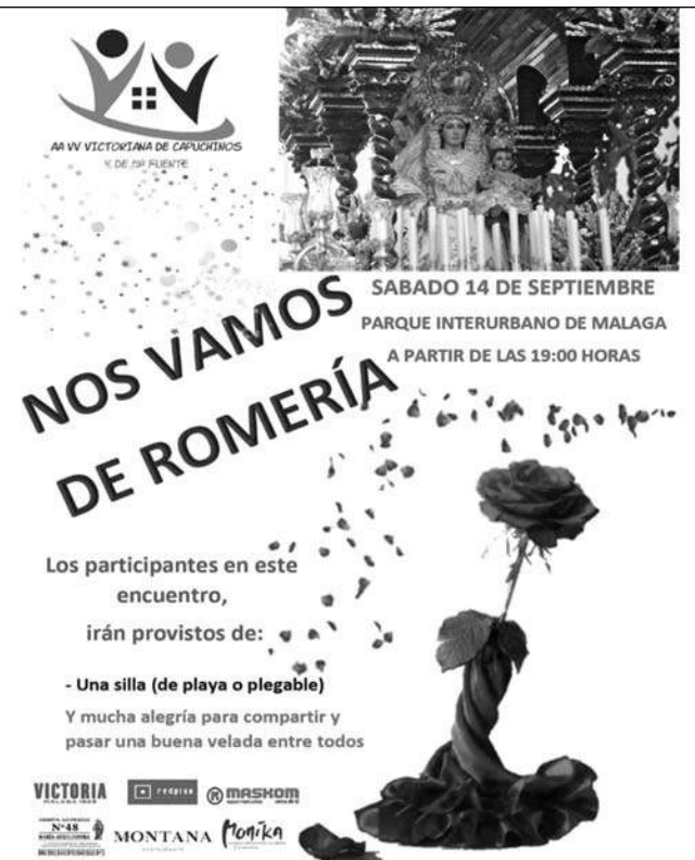
Cartel de la próxima actividad de la asociación.