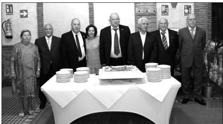
Encargados de cortar la tarta conmemorativa.

actividad para los mayores fueron otras de las ofertas de la caseta de la Peña El Sombrero; una entidad que, ya en su sede, ha disputado la pasada semana el Memorial Ricardo Gómez Aracil de Billar a Tres Bandas.