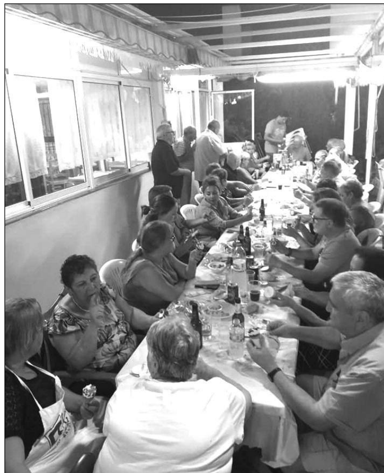
Socios disfrutando el inicio de la feria.