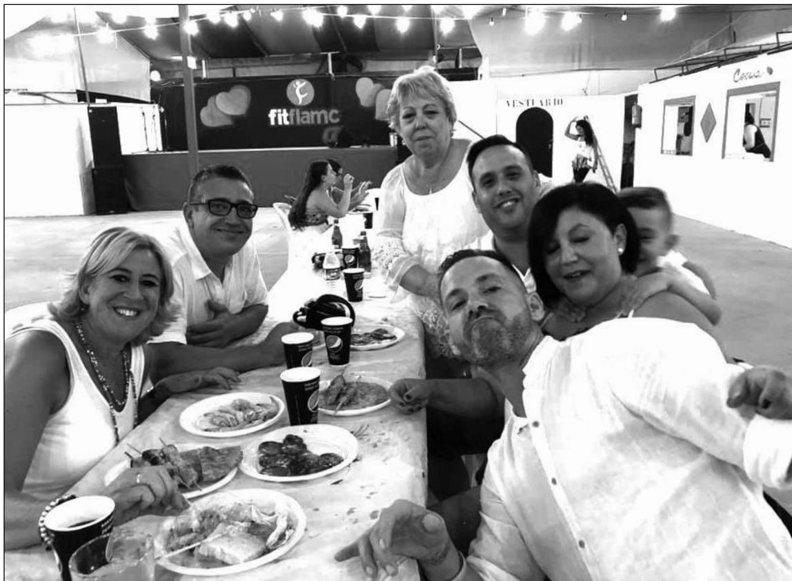
Socios durante la Fiesta Ibicenca.