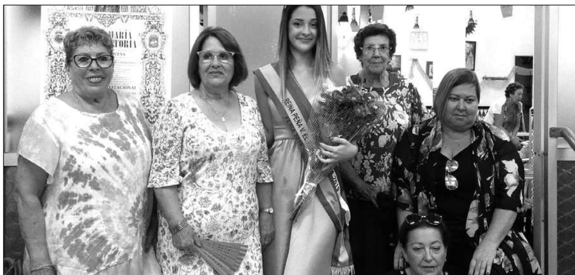
Reina de la entidad con directivas.

El domingo 8 de septiembre la entidad acompañaba a la Virgen de la Victoria en su procesión.