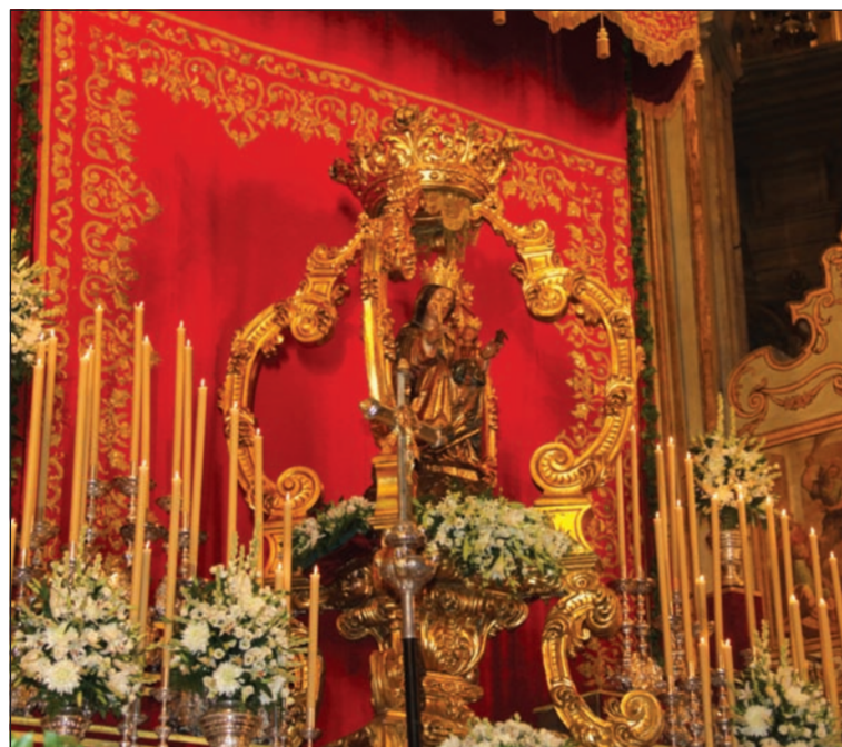
La Patrona, en el altar mayor de la Catedral.

e-mail: prensa@femape.com Web: www.femape.com