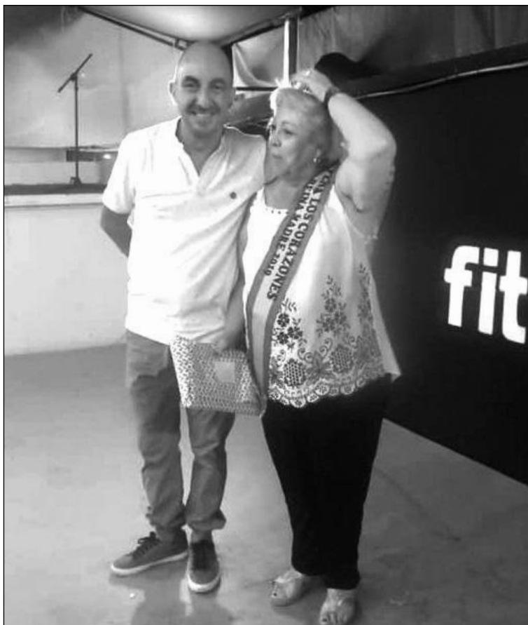
El presidente, con la Reina Madre 2019.