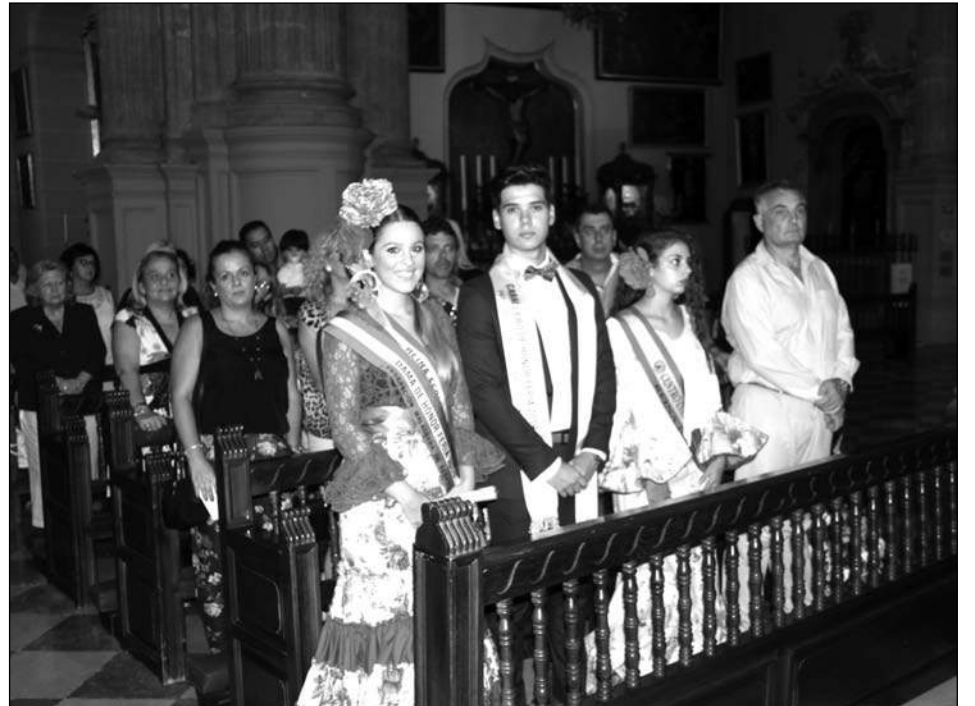
Reinas y Misterys en la Catedral.