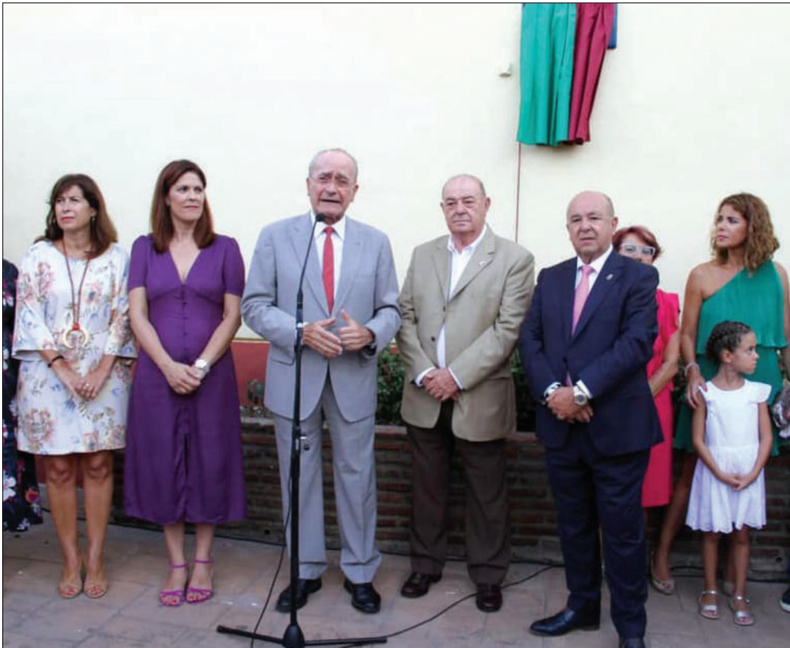
Intervención del alcalde antes de descubrirse la placa.