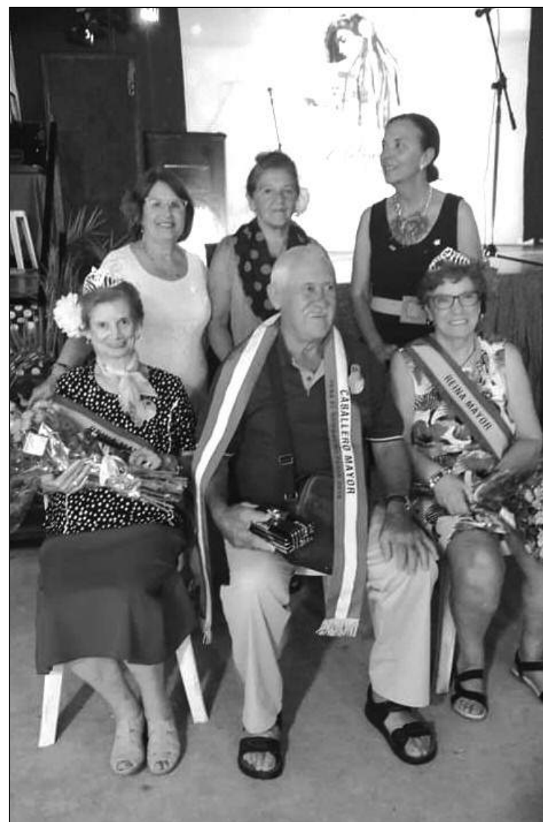
Actividad destinada a los mayores de la entidad.

entrañables, junto a diversas actuaciones, fue el hermanamiento protagonizado con otra entidad federada como es la Asociación de Vecinos de Ciudad Jardín (Avecija).