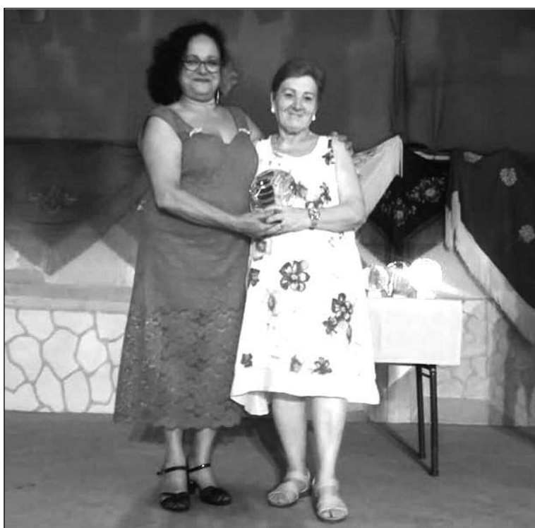
Entrega de premios del torneo de juegos.