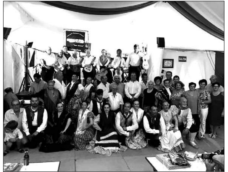
Asociación Juan Navarro en Tarifa.

Pero no solo ha sido la Feria de Málaga la que ha sido testigo de sus representaciones, también en Campillos o Tarifa se ha podido disfrutar de las actuaciones de la Asociación Folclórica Cultural Juan Navarro.