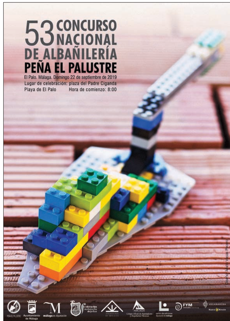
Cartel de esta edición.