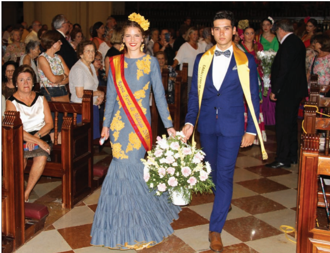
La Reina de la Feria 2019, acompañada por un Caballero de Honor, entrega la ofrenda de la Federación..