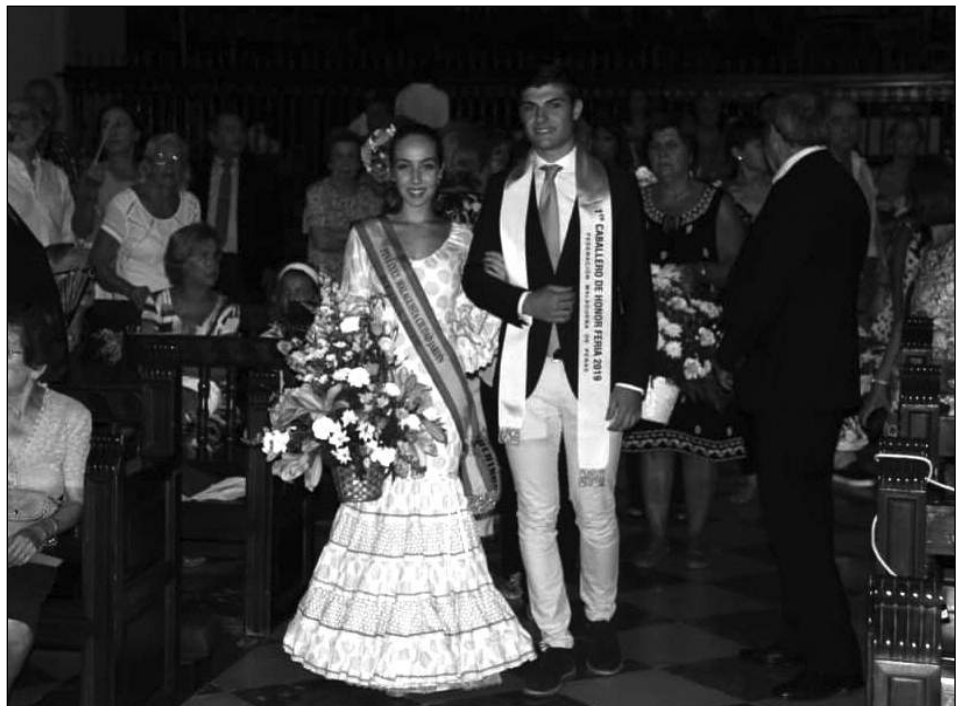
Representantes de una de las entidades federadas.