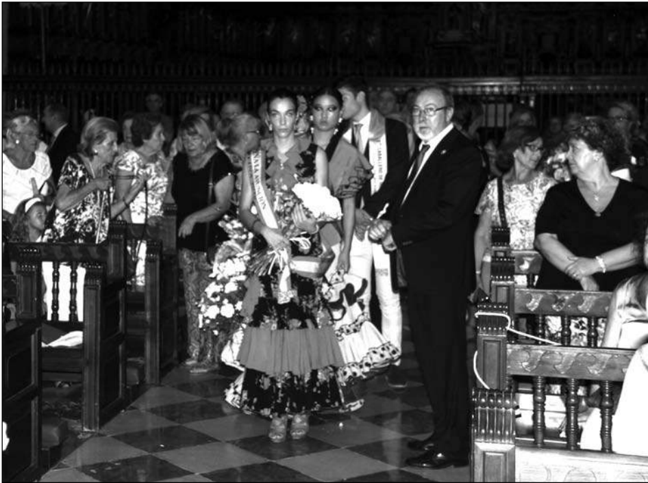
Entrega de un ramo de flores por parte de una entidad.