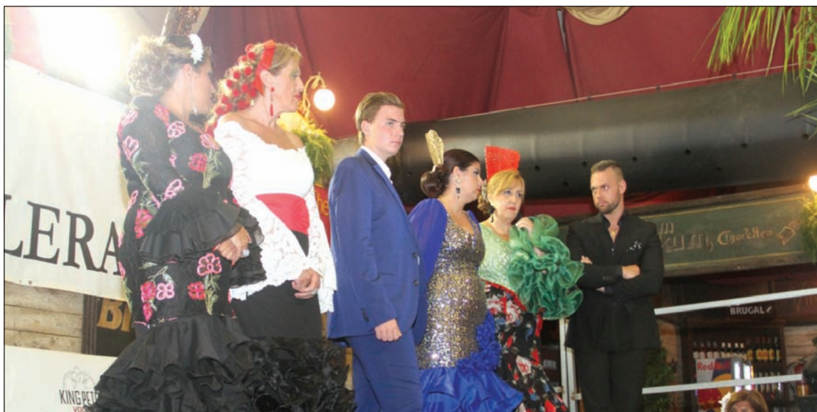
Finalistas aguardan para conocer el nombre de los ganadores.