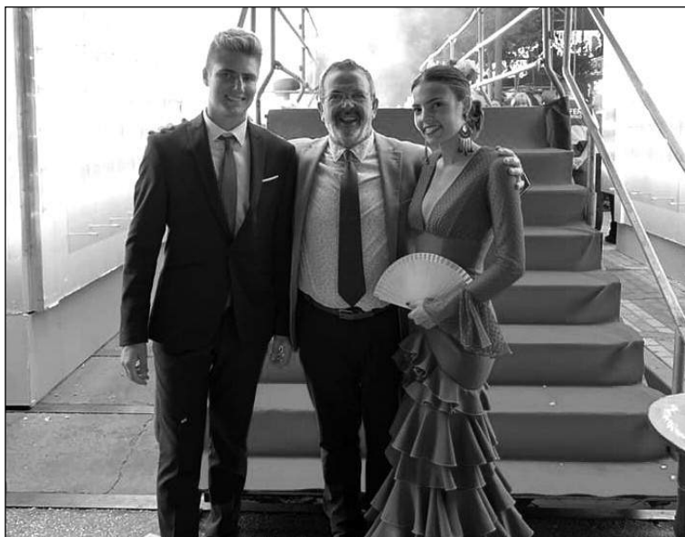
El presidente, con la Reina y el Mister de la Asociación.

La Asociación de Vecinos Hanuca ha realizado un viaje por diferentes puntos de la geografía española. Tras la llegada a Madrid, comenza-