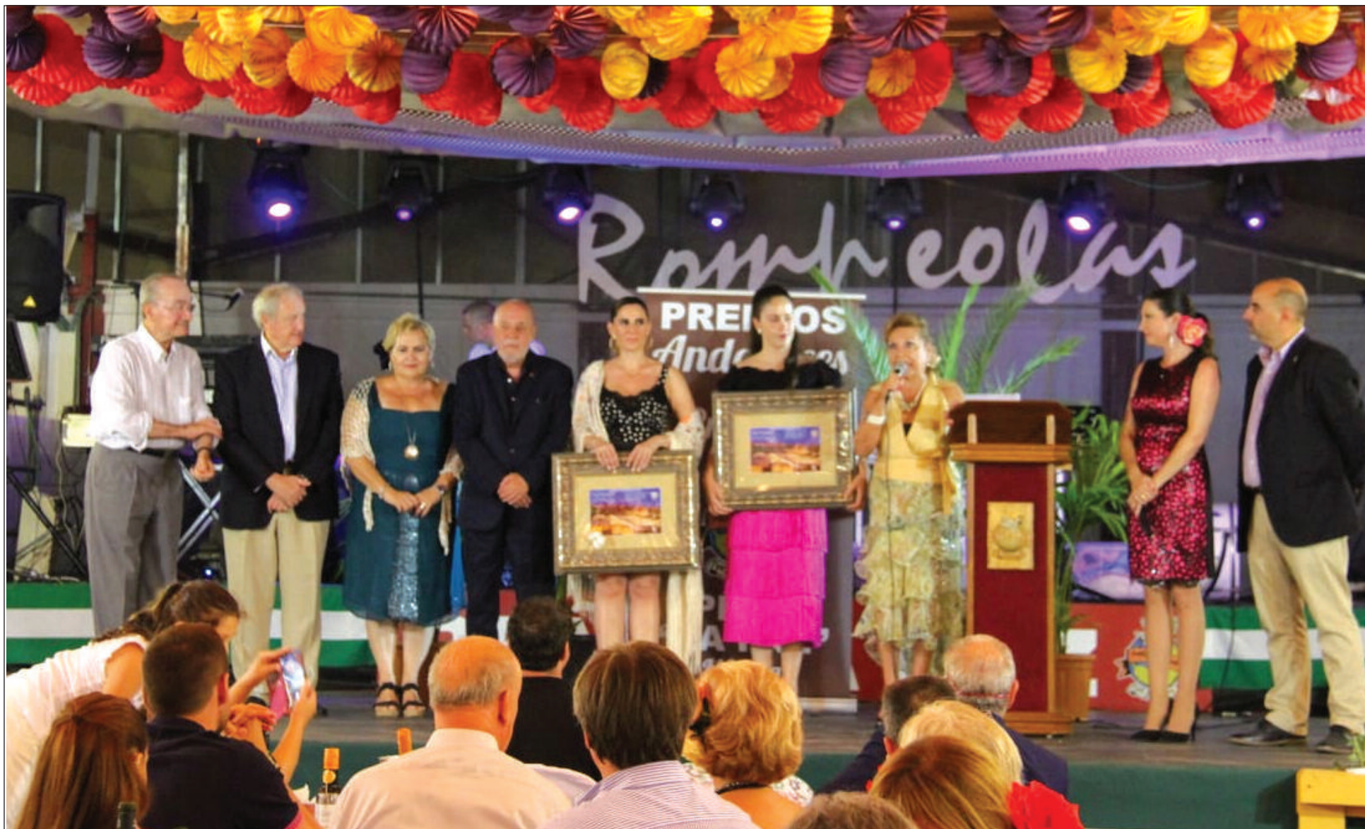
Acto de entrega de los galardones, celebrado en la caseta de la Peña La Paz.