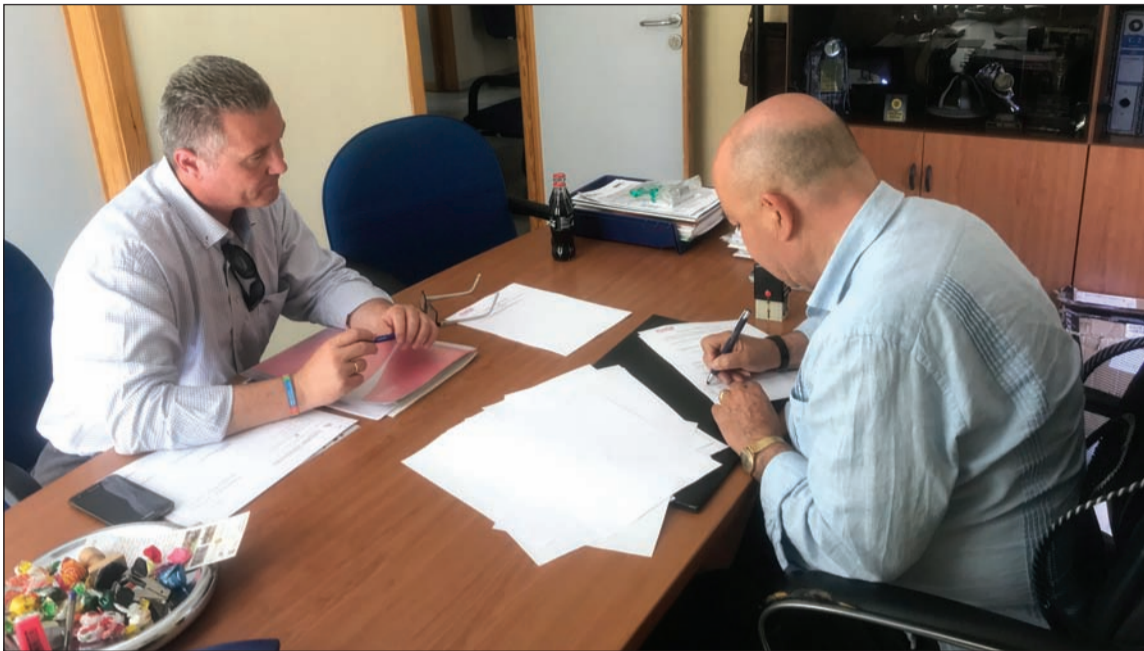
Instante de la firma del convenio.