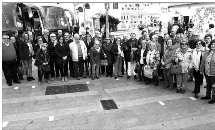
Imagen de grupo durante el viaje a tierras extremeñas.

Esta actividad estaba programada dentro del programa anual de esta entidad perteneciente a la Federación Malagueña de Peñas, Centros Culturales y Casas Regionales 'La Alcazaba'.