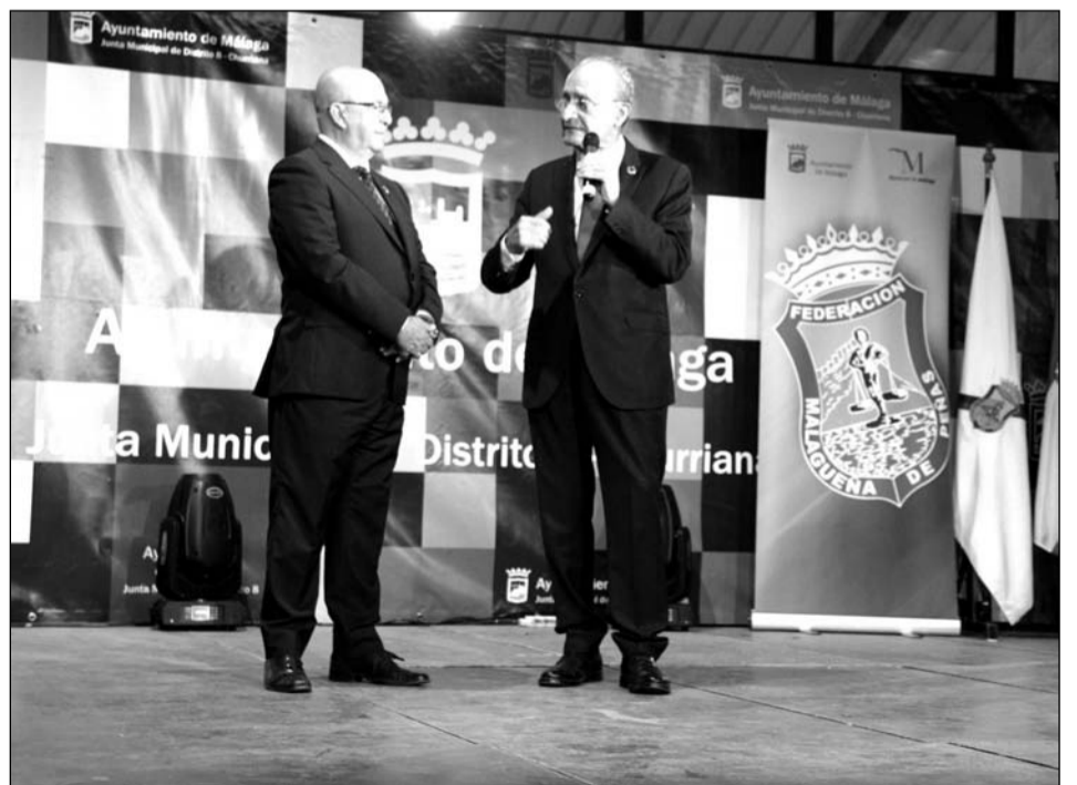
Intervención del alcalde, en presencia del presidente de la Federación Malagueña de Peñas.