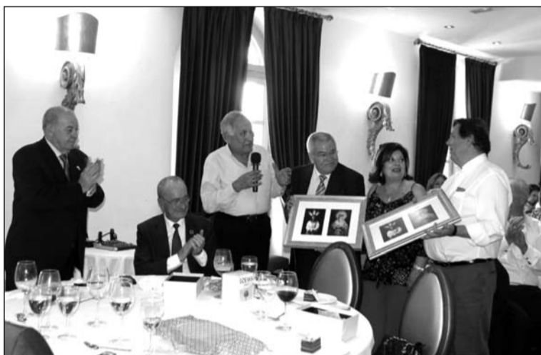
Entrega de cuadros por parte de la Cofradía del Cautivo.