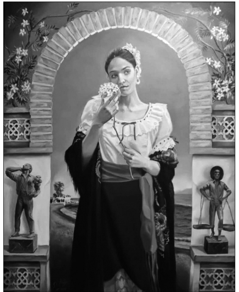
Grupo de teatro del Centro Cultural Renfe.