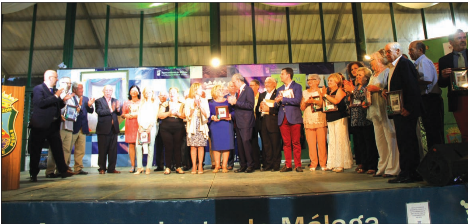
Acto de entrega de trofeos, presidido por el alcalde de Málaga, Francisco de la Torre.

Número 677 12 de Junio de 2019 C/ Pedro Molina, 1 Tfno: 952 22 54 39 Fax: 952 21 48 82 E-mail: prensa@femape.com - fmpalcazaba@gmail.com Web: www.femape.com Edición digital: www.femape.com/laalcazabadigital Twitter: @FMPLaAlcazaba Facebook: www.facebook.com/FMPLaAlcazaba