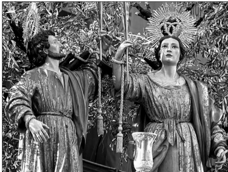
Los patronos, en su trono procesional.

Finalmente, y ya el martes 18 de junio, el obispo de la diócesis Jesús Catalá Ibáñez, presidirá la misa estacional a las 20:00 horas en la parroquia acompañado por el Cabildeo Catedralicio. Aunque es día laborable, el 18 de junio tiene consideración de solemnidad en Málaga capital con misa propia por concesión de la Santa Sede.