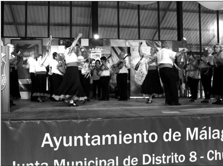
Panda de Verdiales de la Peña La Paz.