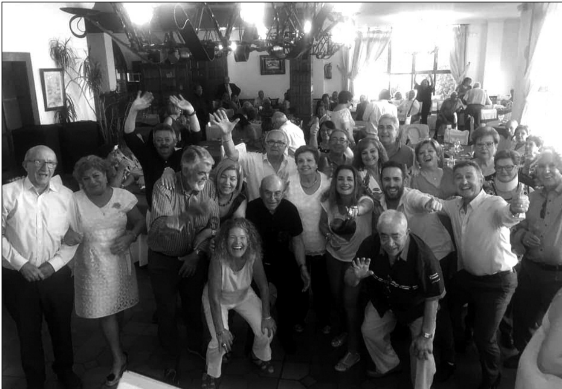
Imagen de grupo durante la celebración.