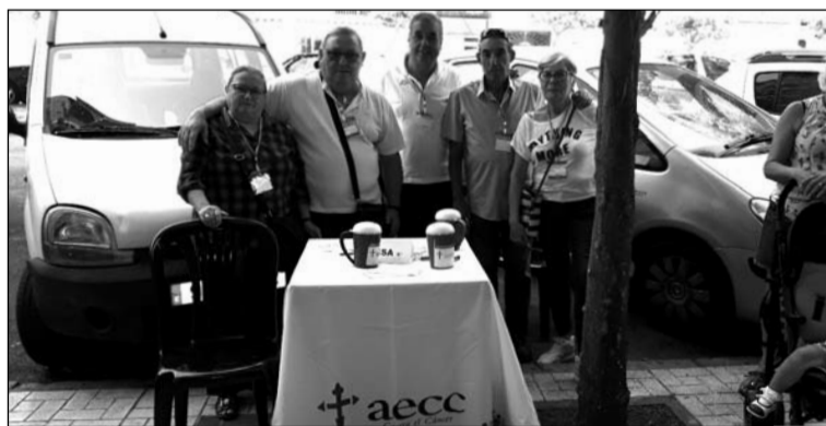
Mesa petitoria de la Peña La Solera.

En la cuestación participaron unos 800 voluntarios en las 250 mesas instaladas en distintos municipios malagueños.