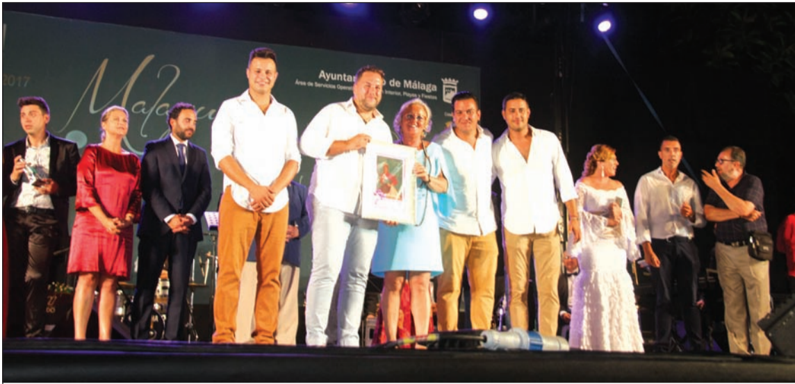
Acto de entrega de trofeos en la edición del pasado año.