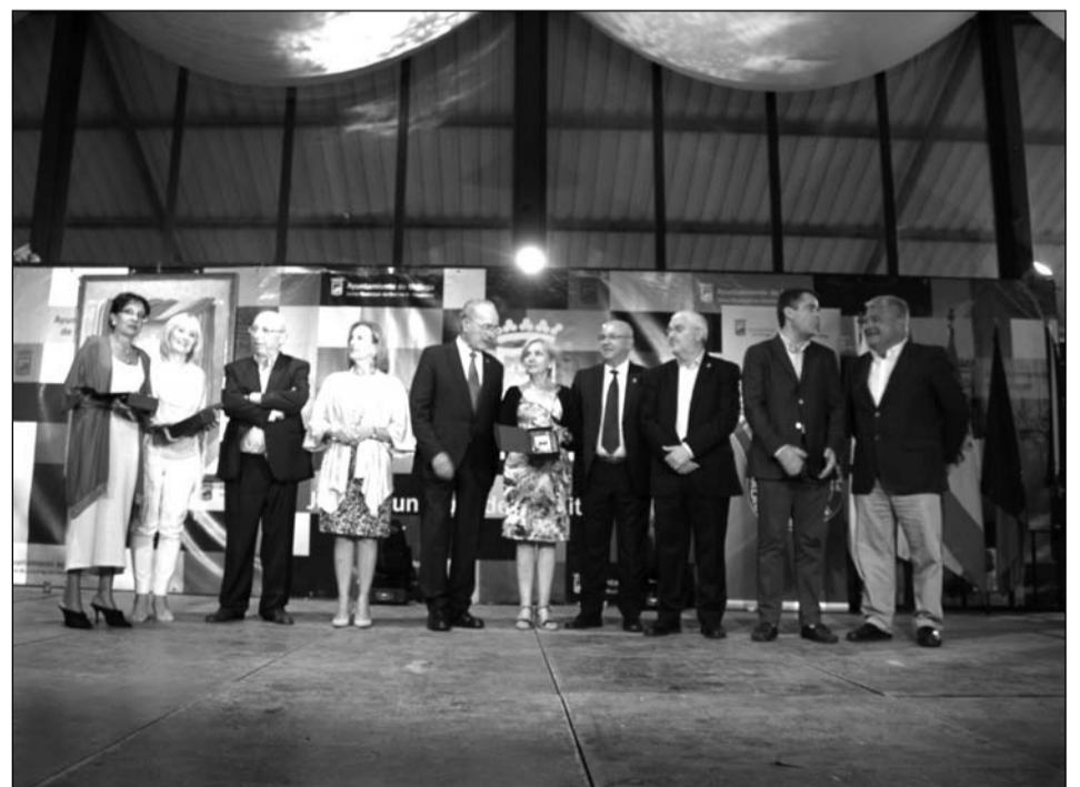
Entrega de un recuerdo a las componentes del jurado.