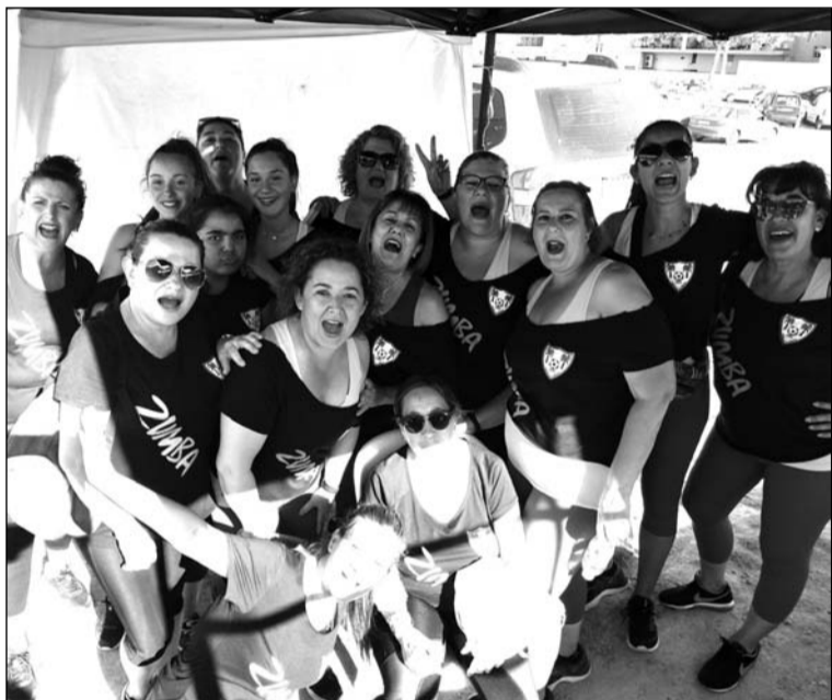
Componentes del grupo de Zumba en la Veladilla del Romeral.

Además, la solidaridad no se limita a esta actividad, sino que está presente en el día a día de la peña, con actos como la colaboración que el pasado fin de semana prestaban las componentes de su grupo de Zumba en la Veladilla de El Romeral; así como en las próximas actuaciones que tienen previstas para las próximas semanas.