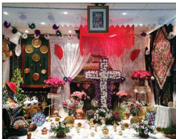
Peña Nueva Málaga.