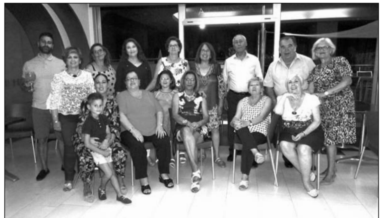
Componentes de la Peña La Florida en el hotel de Almuñécar.

Así, los socios de la entidad federada se trasladaban hasta un hotel de la localidad granadina donde disfrutaron entre el 31 de mayo y el 2 de junio.