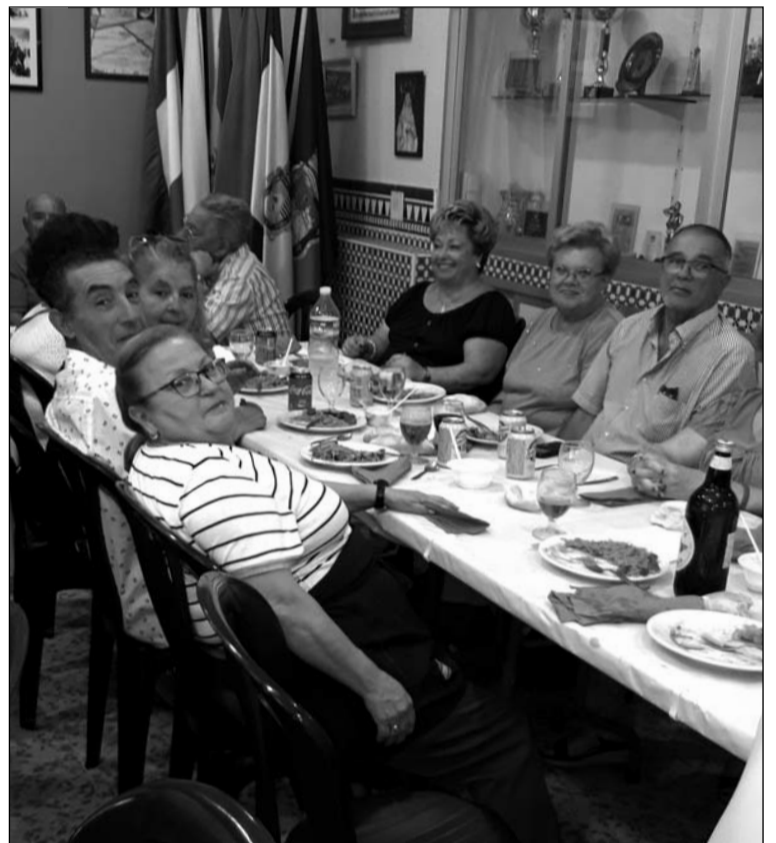
Socios de la Peña La Solera.

Así, tras compartir el almuerzo, los peñistas disfrutaron de una agradable jornada de hermandad entre todos ellos en su sede.