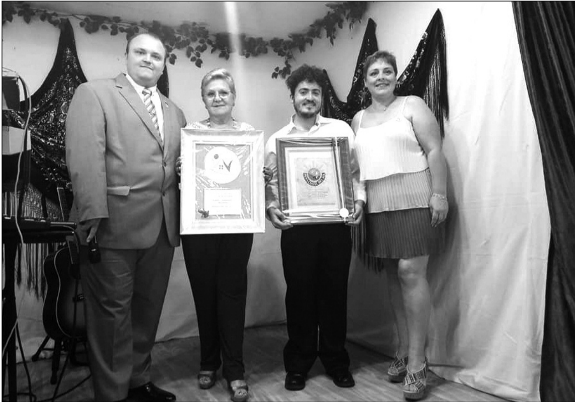
Los presidentes con los padrinos del hermanamiento.