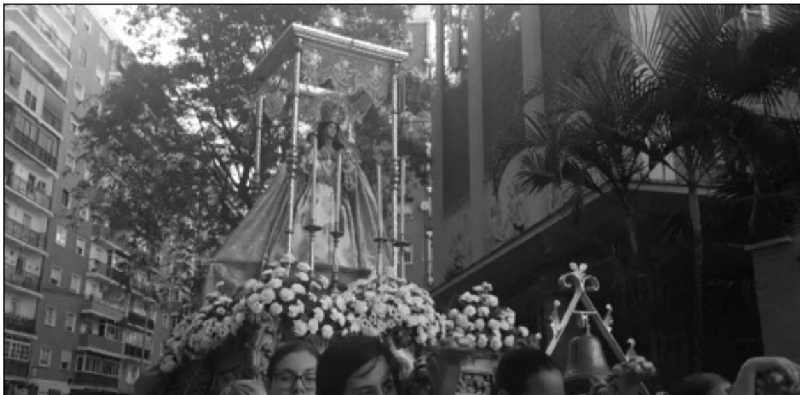
Imagen de la procesión.

El pasado jueves 30 de mayo se vivía un día muy emotivo para la Peña La Paz, ya que en esa jornada procesionaba a hombros de mujeres de trono la Sagrada Imagen de la Virgen del Sol, Reina de la Paz, que durante todo el año permanece en su sede.