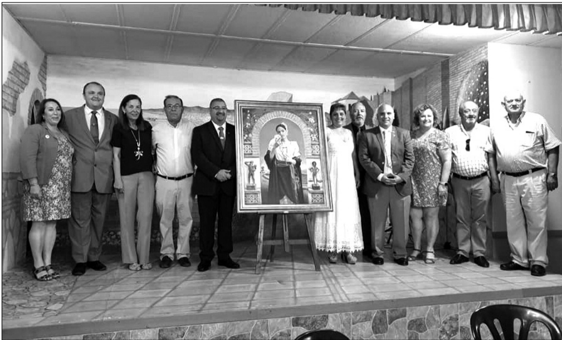
Acto de presentación del cartel de la Fiesta de la Biznaga.