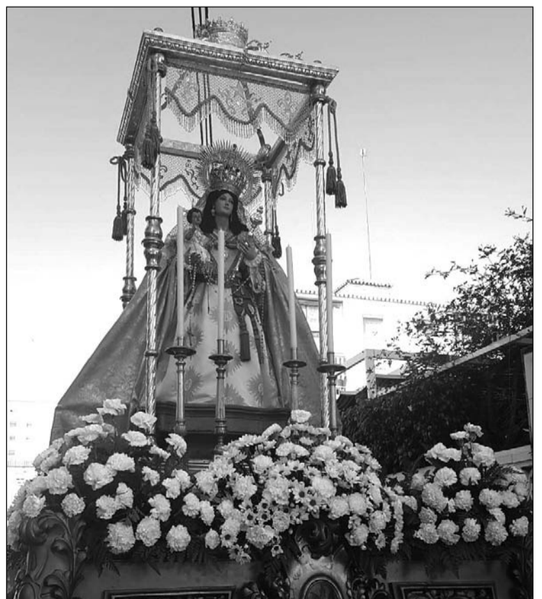
La Virgen del Sol, en su trono procesional.