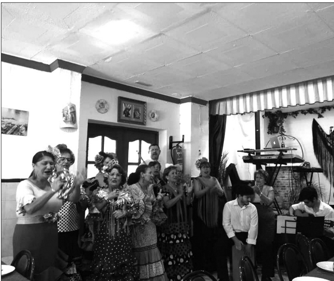
Coro Aire Victoriano, durante su actuación en este acto.

En el transcurso del acto se contaba con la actuación del Coro Aire Victoriano y la orquesta Lourdes Millán.