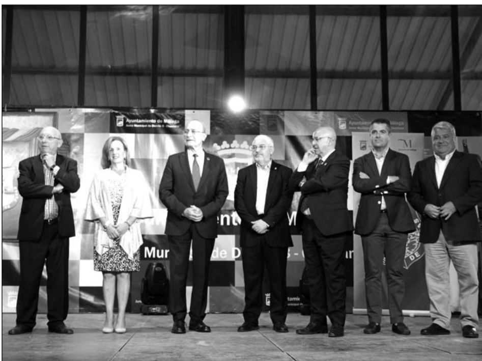
Autoridades y patrocinadores asistentes al acto.