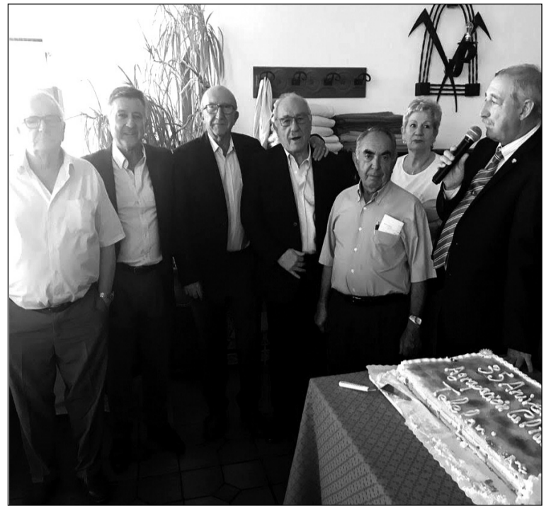
Intervención del presidente.

cer mucho o poco, depende de como se mire. Ni mucho ni poco, lo suficiente para ya formar parte del tejido asociativo y peñista de Málaga, pero de una