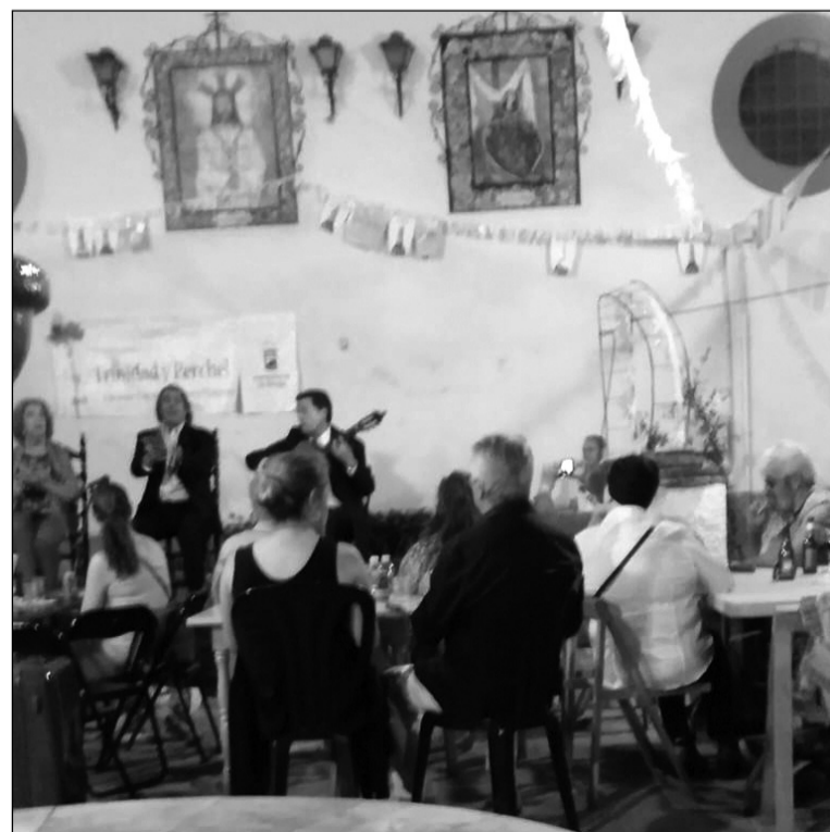
Verbena en la Trinidad.