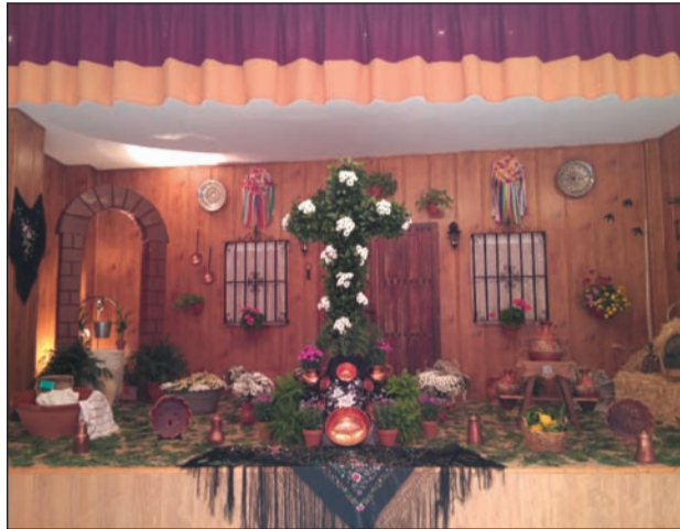
Peña Santa Cristina.