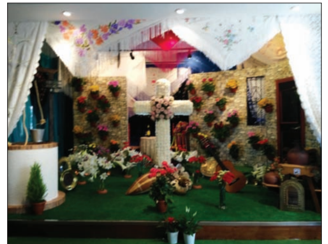
Casa de Melilla en Málaga.