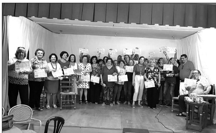
Participantes en el concurso gastronómico.

Por otra parte, el jueves 6 de junio, el Centro Cultural Renfe fue otra de las entidades pertenecientes a la Federación Malagueña de Peñas, Centros Culturales y Casas Regionales 'La Alcazaba' que colaboró con la Asociación Española Contra el Cáncer en su Cuestación.