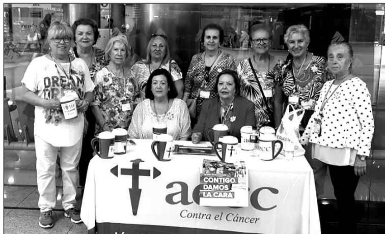
Socias colaborando con la AECC.