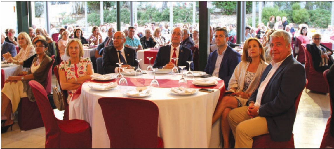
Vista general del acto, con la mesa de autoridades en primer plano.