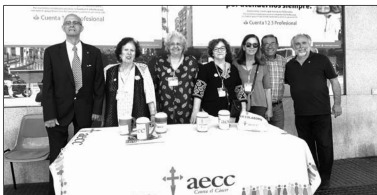
Mesa de la Peña El Sombrero.