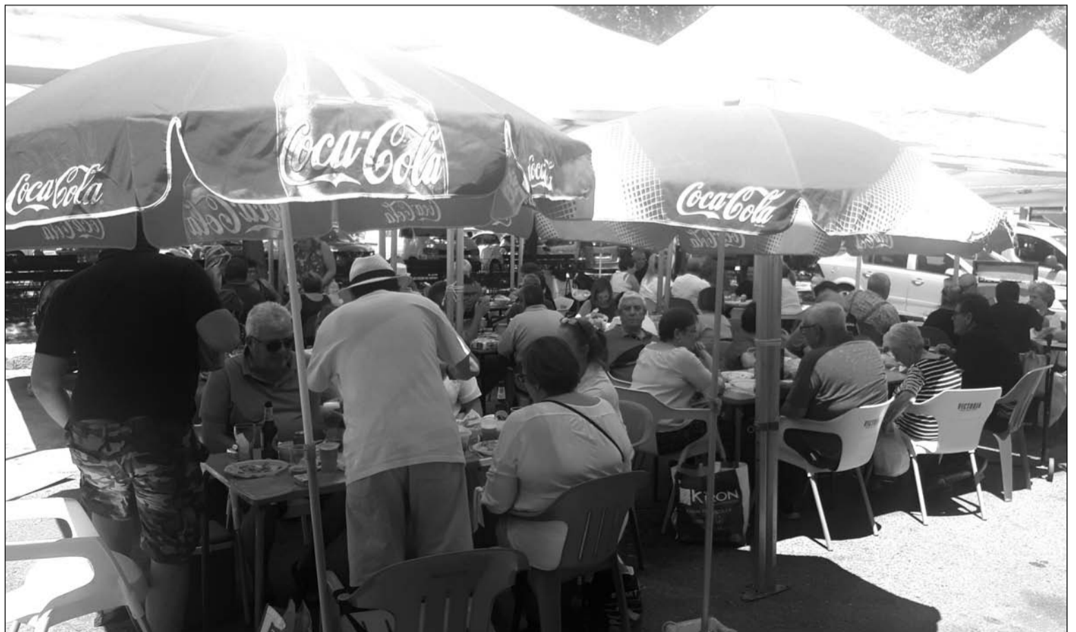
Vista general de la terraza de la entidad durante esta actividad.

Sin embargo, en esta ocasión el encuentro no tenía lugar en los salones interiores, como es habitual, sino que la sede salía a la calle con sus mesas y sillas para compartir un almuerzo que contaba como comida principal con una paella.