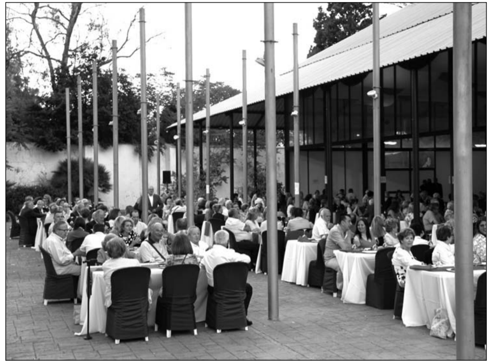
Vista general del acto celebrado en la Finca La Cónsula.