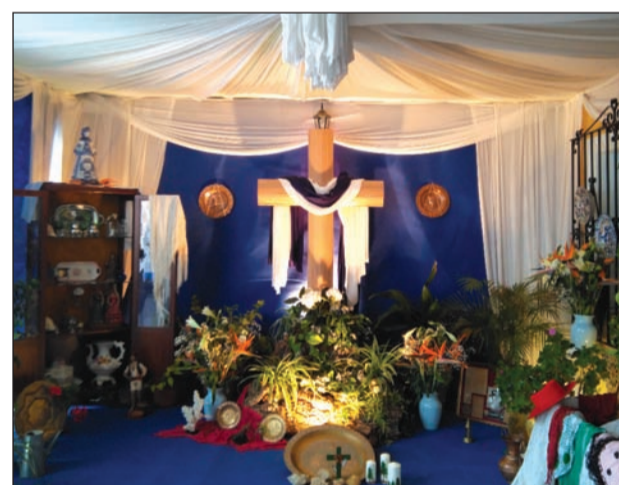
Peña El Sombrero.

Hay cosas que son exclusivamente malagueñas