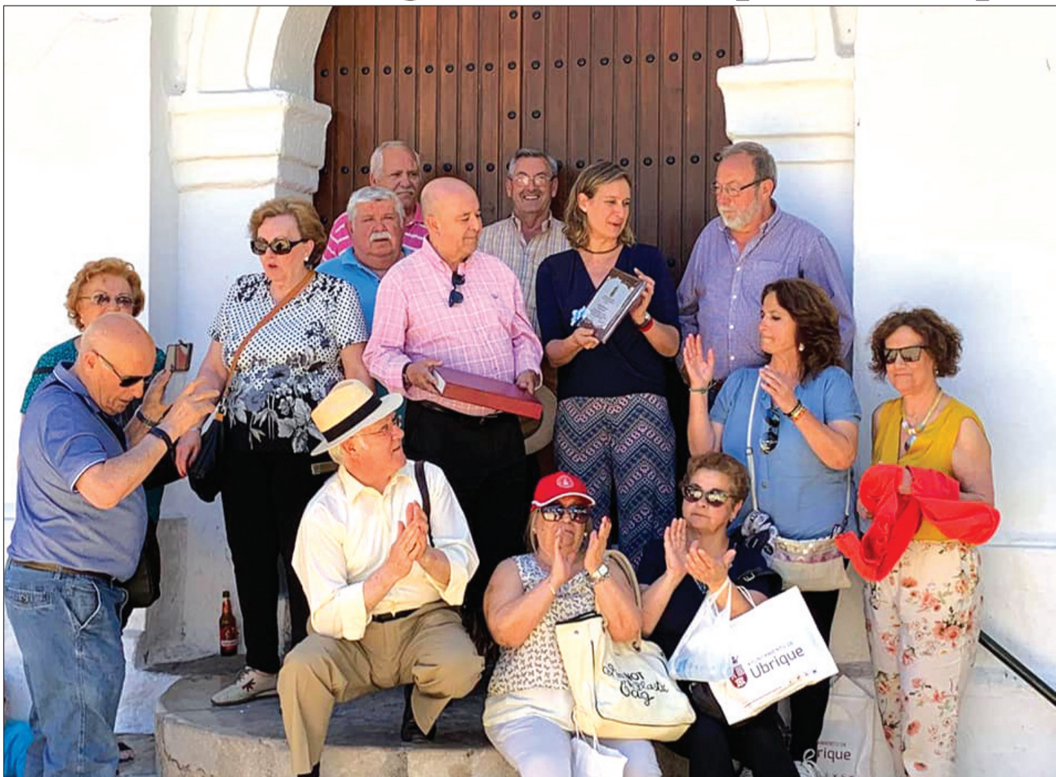
Entrega de un recuerdo a la alcaldesa de Ubrique en la puerta del Ayuntamiento.

Entidades colaboradoras con esta publicación: