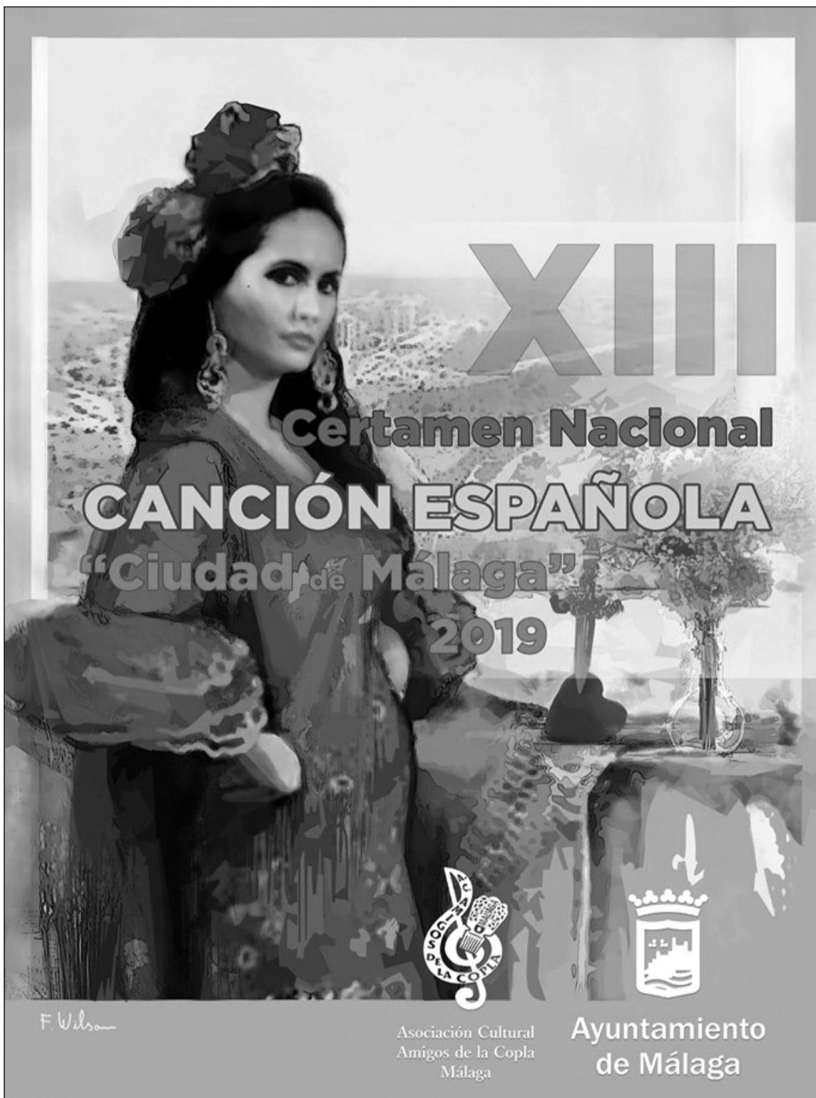
Cartel del certamen, realizado por Fernando Wilson.