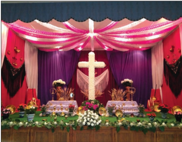
Casa de Álora Gibralfaro.