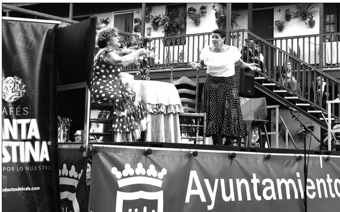
Actuación teatral en el Corralón de Santa Sofía.