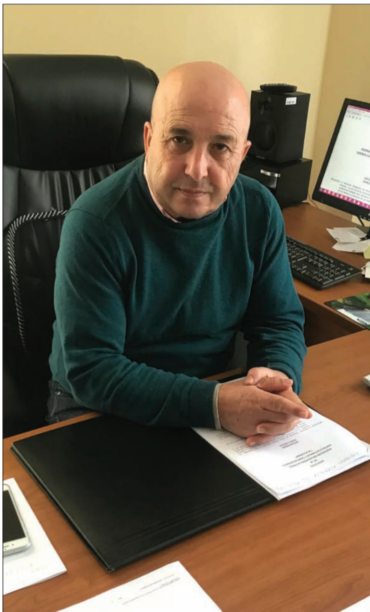
El presidente de la Junta Gestora de la Federación Malagueña de Peñas.

Yo creo que ha aportado mucho y tiene aún mucho más que aportar a nivel cultural, de tradiciones, de ser lugares de encuentro.. Las peñas, entre otras cosas, cumplen la función social de ser un punto de encuentro donde las personas pueden convivir y compartir, y eso, si no existieran, habría que inventarlo.