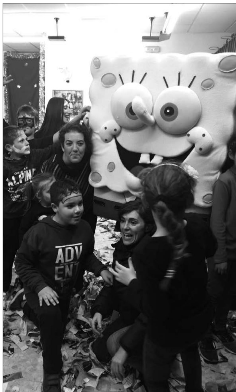
La presidenta, jugando con los niños.