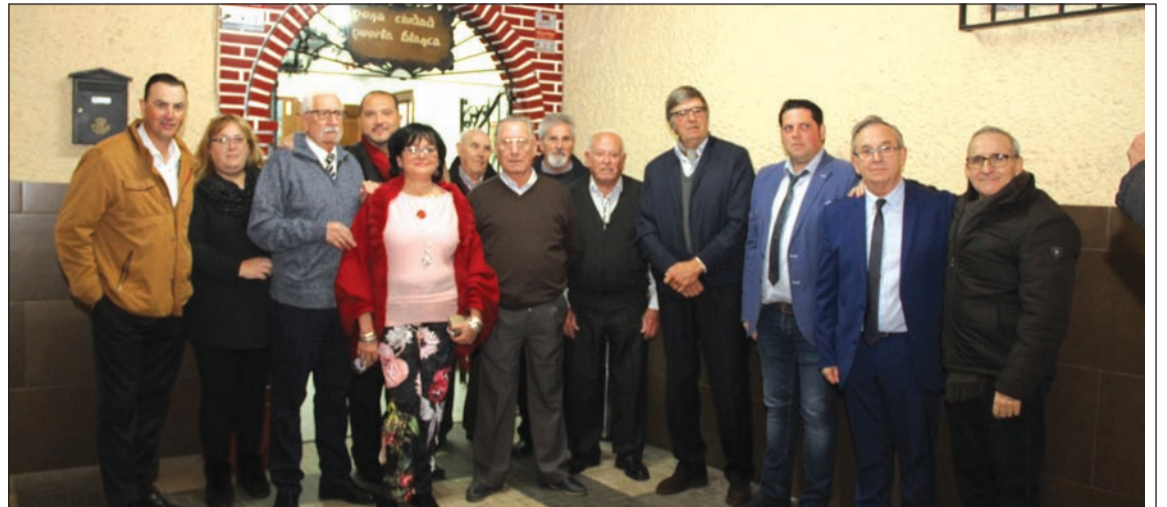
Participantes en la primera semifinal con la presidenta y otros miembros de la entidad organizadora.

El cantaor ganador se verá obligado a actuar al año siguiente en el acto de presentación del cartel.