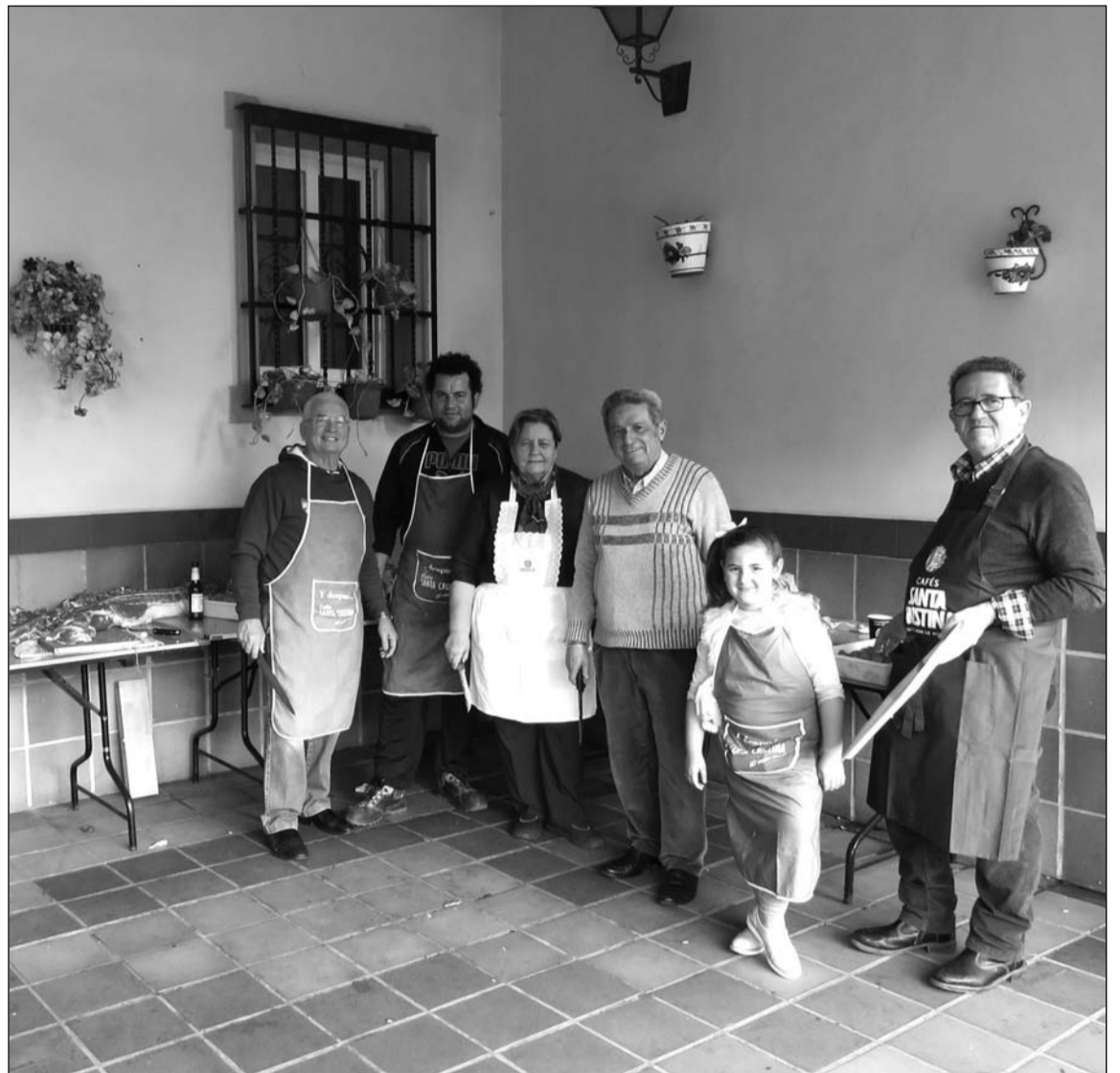
Colaboraron en la matanza socios de todas las edades.

Se hizo un paréntesis para disfrutar de una paella elaborada por los propios socios, y que sirvió para fortalecer los lazos de hermandad en una jornada diferente y que cada año es esperada por los integrantes de la entidad.