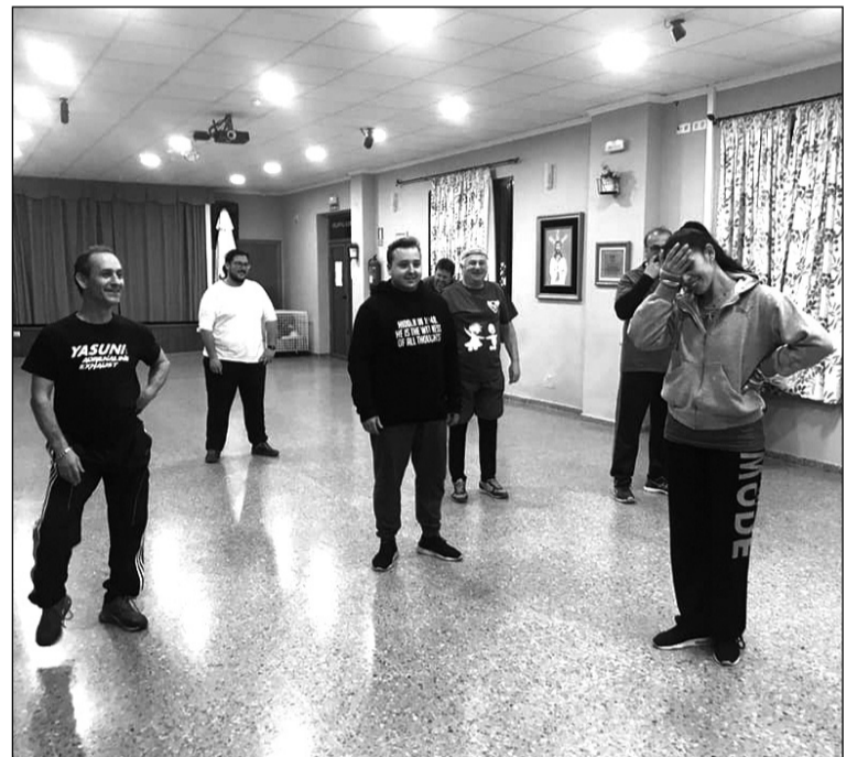
Simpatía en la primera clase de zumba para hombres.