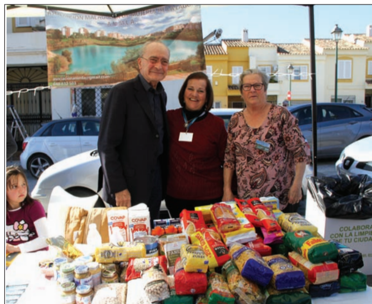
El alcalde, con voluntarias de la Asociación de Mujeres La Laguna.