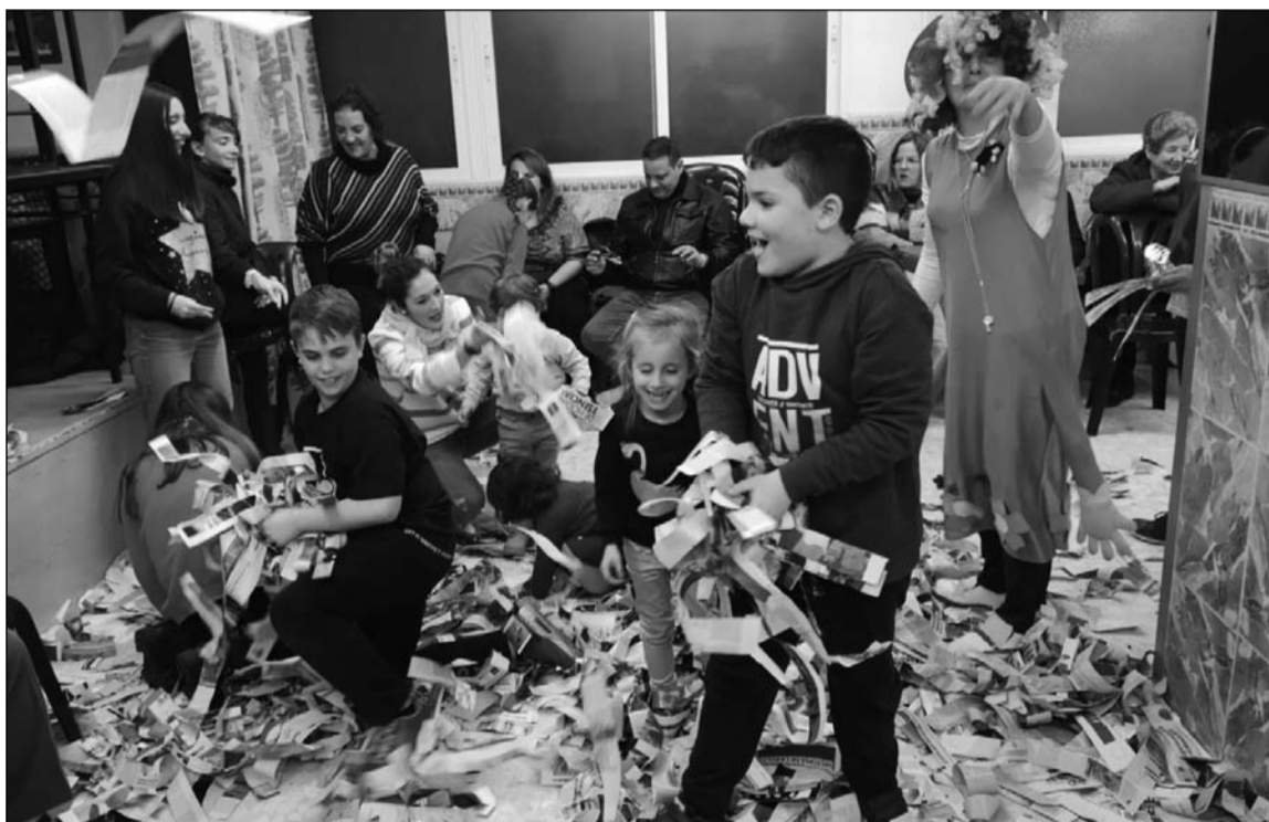
Niños jugando en la sede.