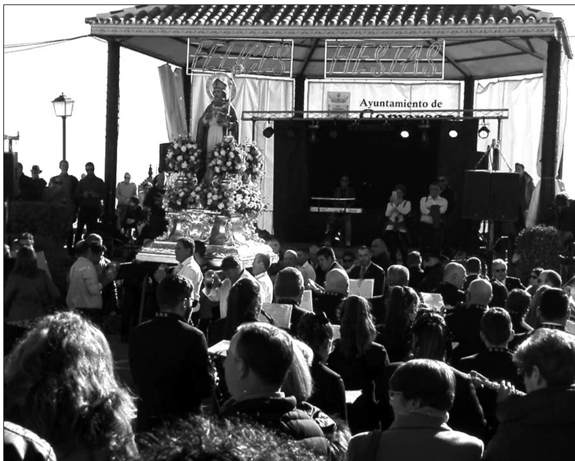
Los peñistas presenciaron la procesión de San Hilario.