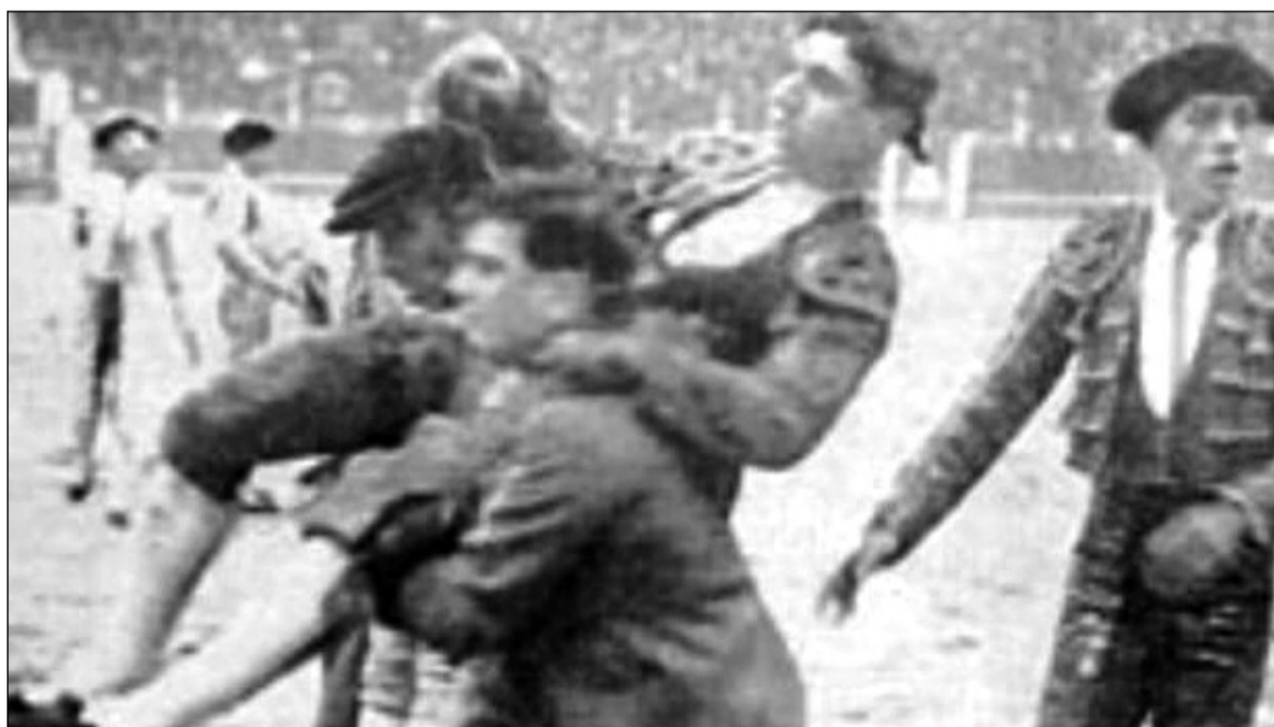
Momento en el que Manuel Báez 'Litri' es conducido a la enfermería de La Malagueta en febrero de 1936.

Antes, el sábado 19 de enero se podía disfrutar, a partir de las 17:00 horas, de la proyección del documental 'Sangre y Arena en La Malagueta', que pertenece a la serie 'Málaga y sus historias' y está dedicado a la cogida y muerte del torero Manuel Báez 'Litri' en 1936.