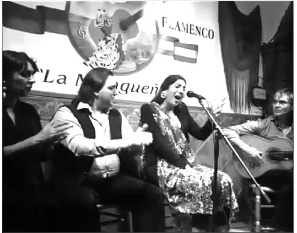
Imagen de la actuación del pasado 19 de enero.

Esta malagueña ha actuado a lo largo de su carrera profesional en multitud de teatros, auditorios y festivales que le sirven para adquirir experiencia y aprender el oficio. Entre estos festivales destaca la Luna Mora de Carratraca, Río del campo (Río gordo), el Festival Flamenco de Canillas de Aceituno, el primer festival flamenco de Romi y el festival de flamenco de Ginebra, entre otros. Ha formado parte de distintas compañías flamencas como las de La Lupi o la de Joaquín Cortés, con la que ha trabajado en Rusia, Sudamérica, Miami, Estados Unidos, Turquía, México, Portugal, Madrid y Barcelona.