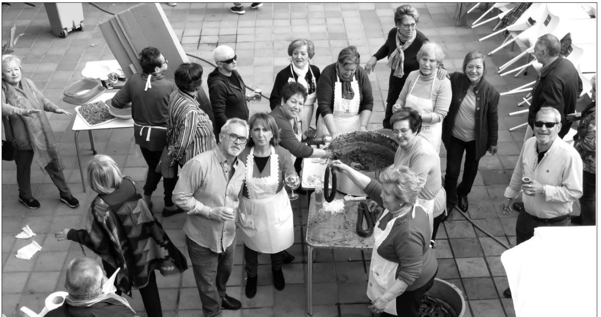
Preparación de la morcilla, alrededor de una matanza que se convirtió en una gran fiesta de convivencia.