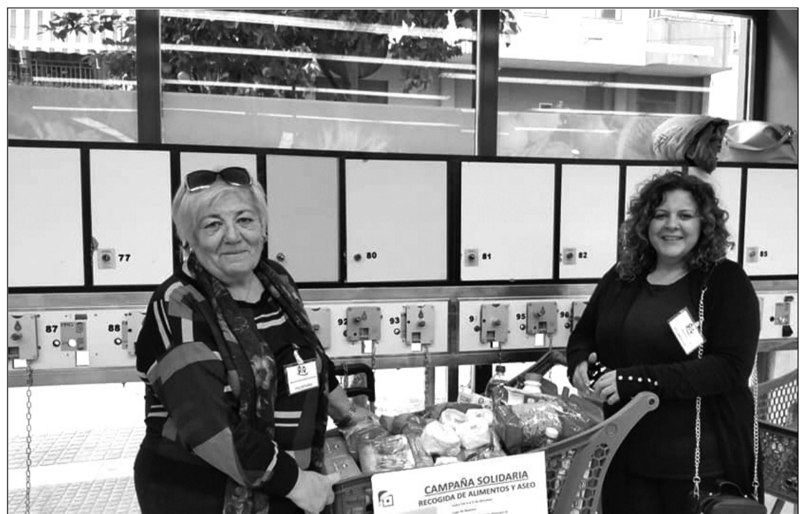
Voluntarias en un supermercado Maskom, que además esta semana se ha convertido en patrocinador de la asociación.

También han colaborado con el comedor social de Miraflores, Cotoengo de Huelin, Cáritas de Fuente Olletas, Colegio Salesianos, Cáritas de Capuchinos, la Hermandad de la Alegría, la Pro Hermandad del Sol, la Confraternidad de la Llagu y Buena Fe, la Peña los Corazones, la Peña Victoriana el Rocío