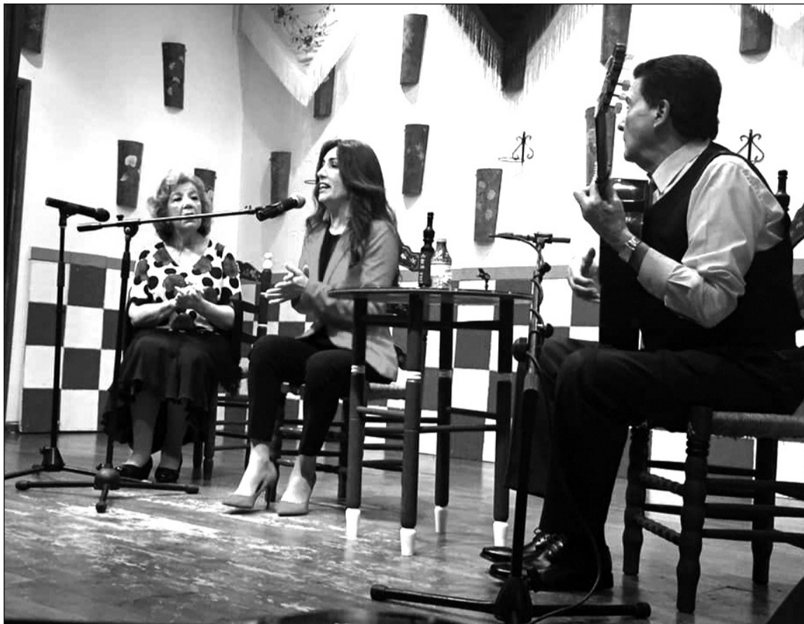
Un instante de la actuación.