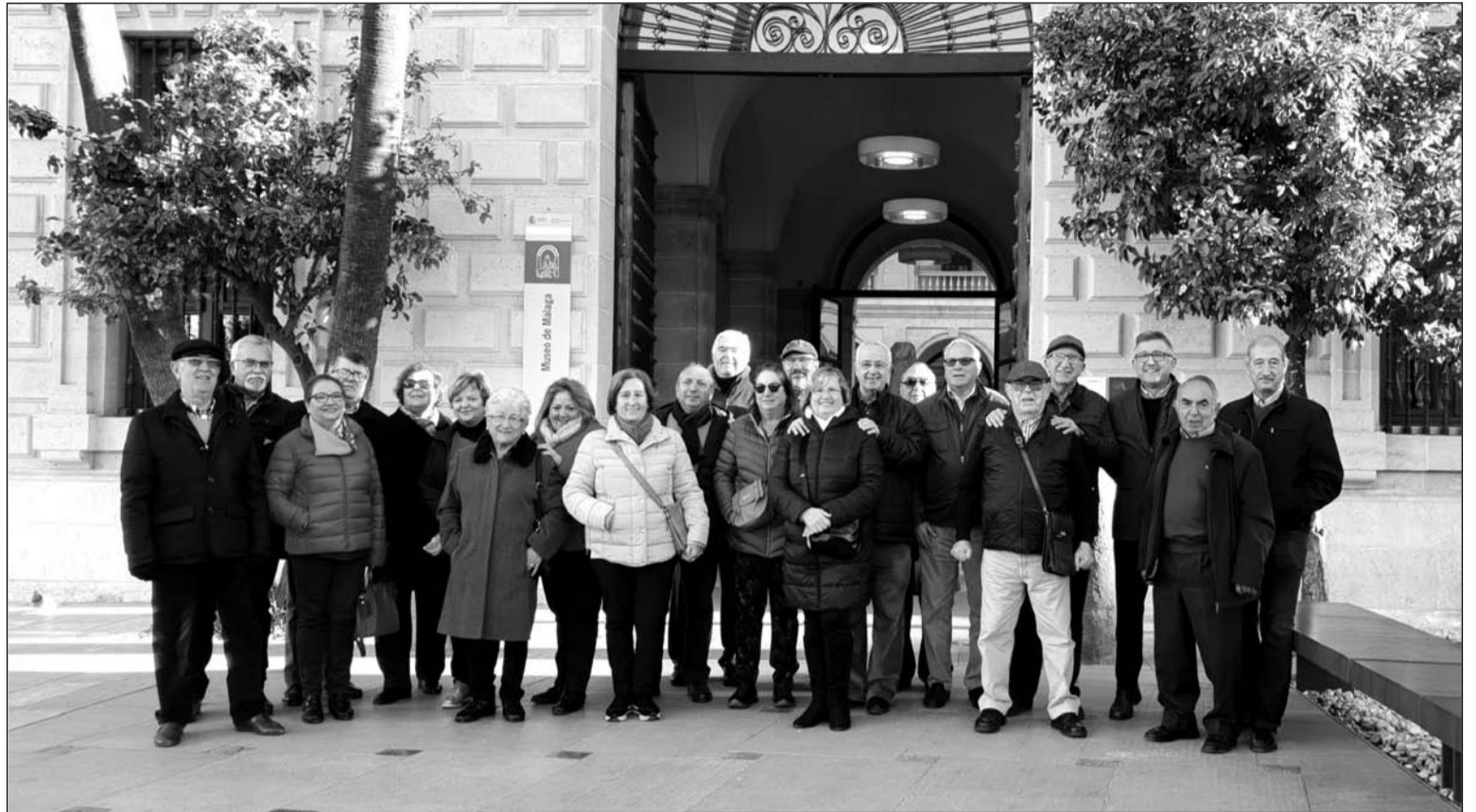
Uno de los grupos en el exterior del museo.

Satisfacción total es lo que dejó cada una de las visitas.