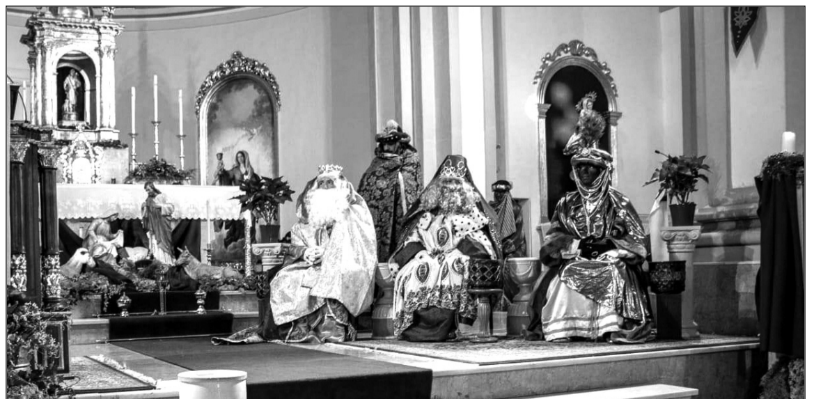
Visita de los Reyes Magos a la iglesia de la Santísima Trinidad.

Numerosos pequeños esperaban a los Magos de Oriente en una cita inolvidable para ellos, y que estuvo cargada de la ilusión propia de esta festividad.