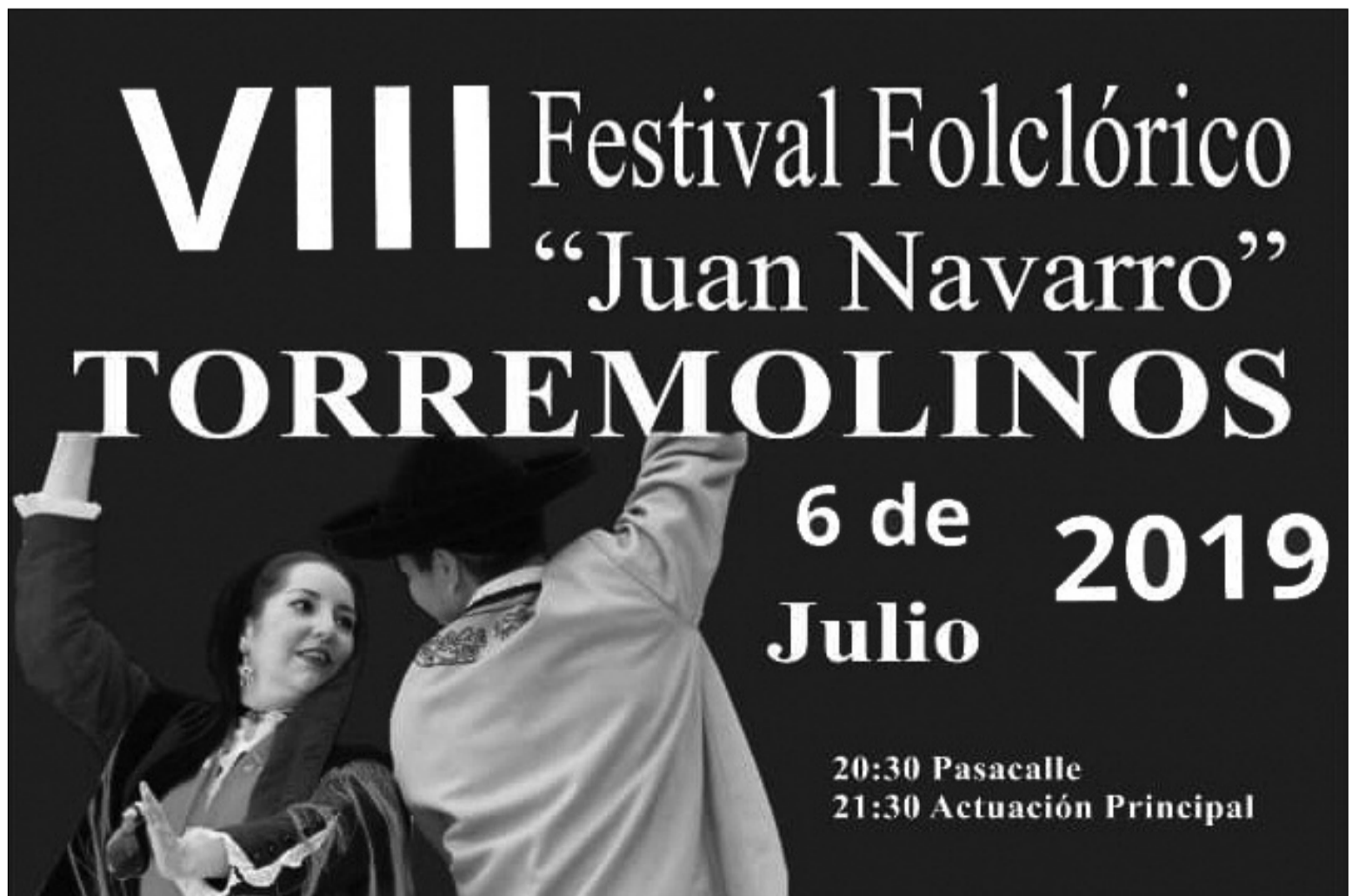
Avance del Festival Folclórico de Torremolinos 2019.

El Festival Folclórico de Torremolinos tenía lugar el pasado año 7 de julio de 2018 en su séptima edición, y reunía sobre el escenario al Grupo de Música y Danza 'Los Chachipés', de El Escorial (Madrid); el Grupo Folklórico 'Pueblo de Aljibe' de Santa María de los Llanos (Cuenca) y la Asociación Folclórica Cultural 'Juan Navarro' de Torremolinos, anfitriona del certamen.