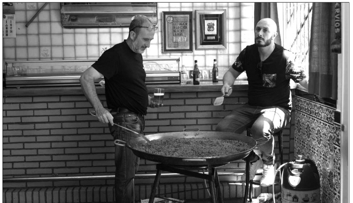
Imagen de archivo de unos socios de la Peña El Bastón preparando unas Migas, como harán el 2 de febrero.

De cara a las próximas semanas, para el sábado 2 de febrero a las 14:30 horas se anuncia una Comida de Amistad en la que los asistentes degustarán las tradicionales Migas Bastoreras al estilo de Baena.