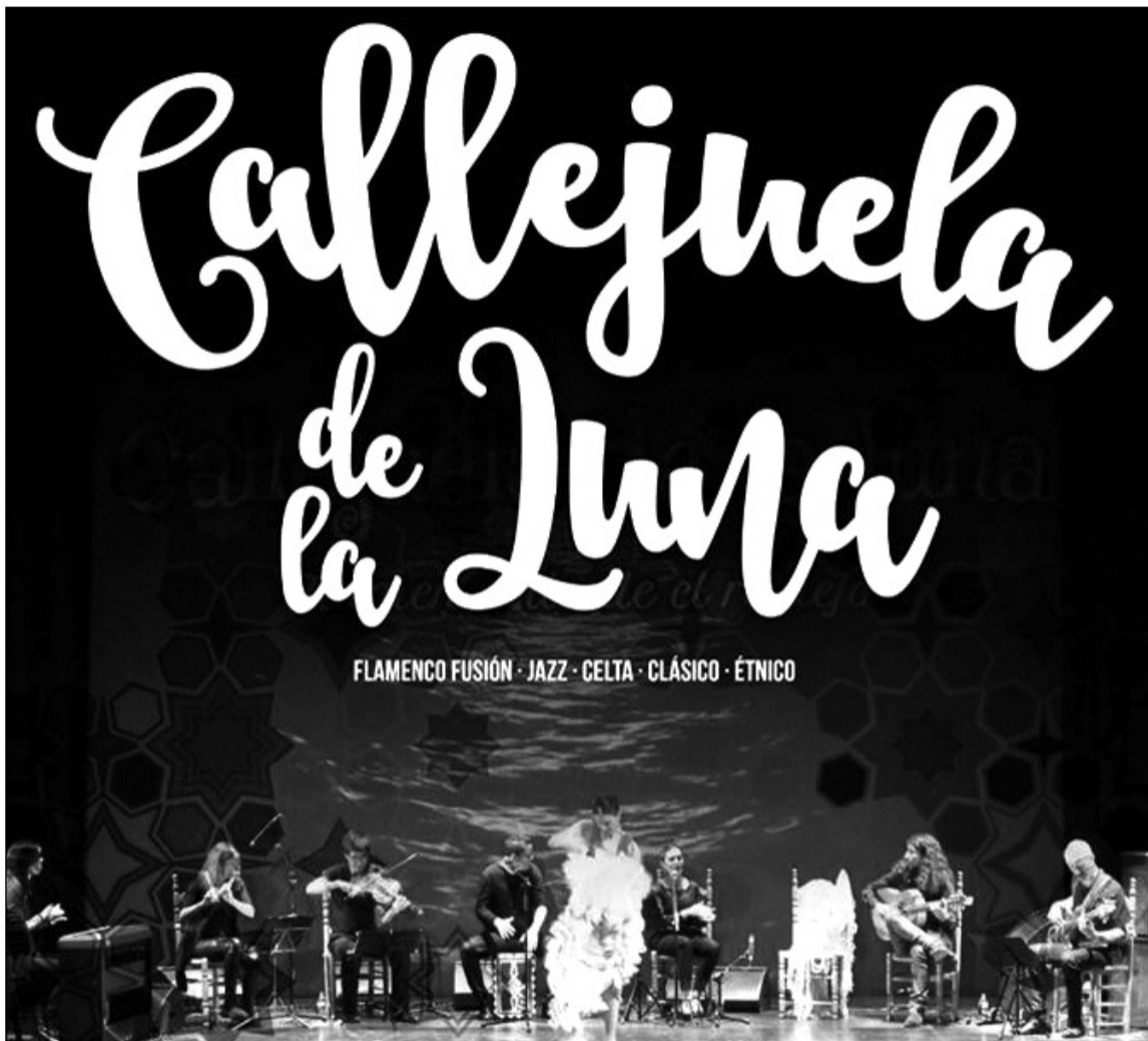
Detalle del cartel de la actividad.