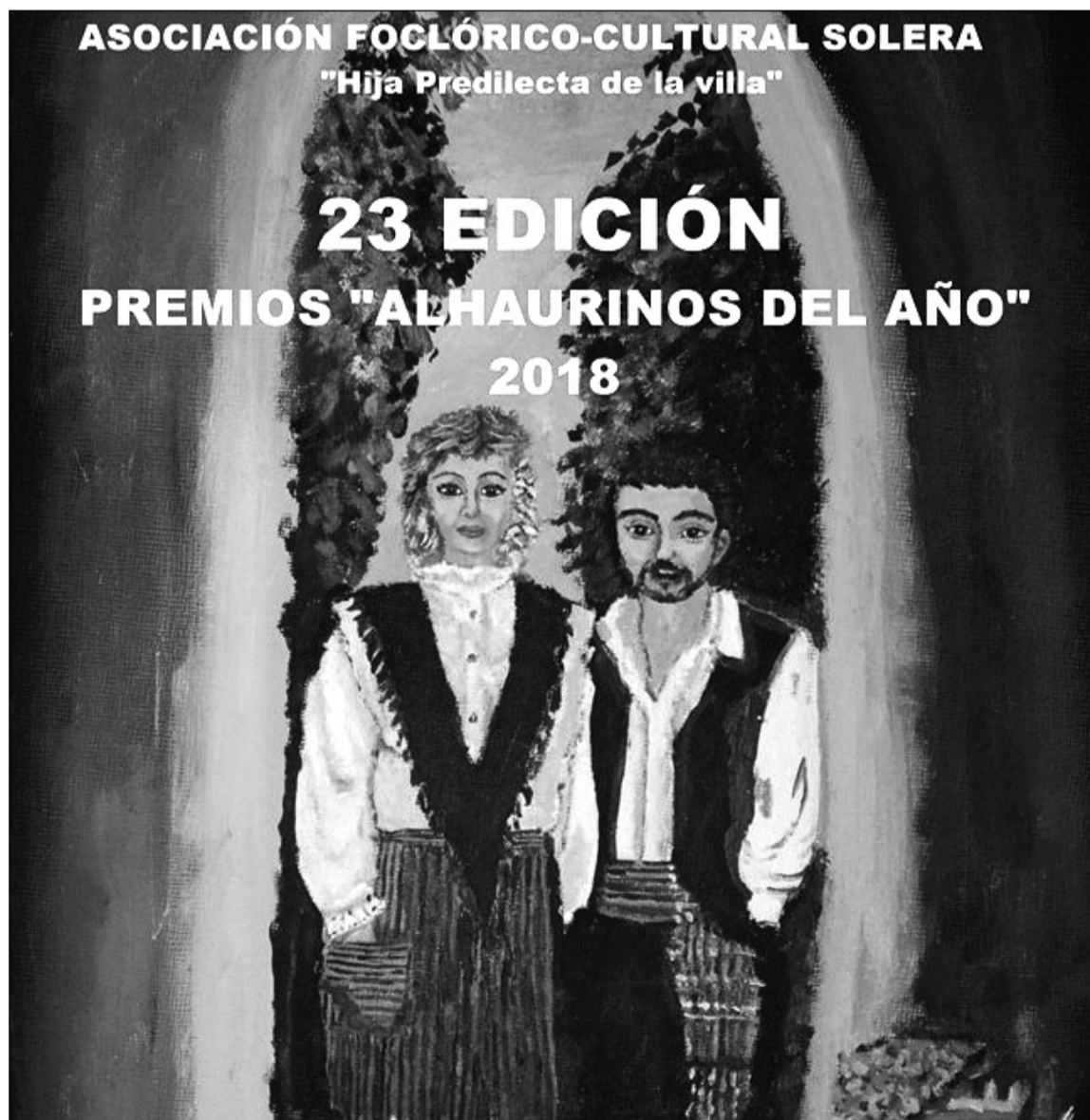
Detalle del cartel de esta actividad.