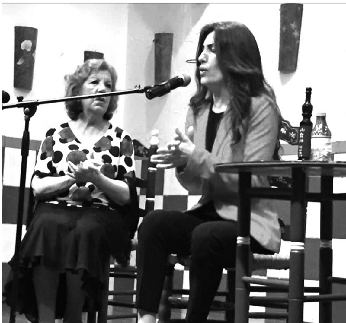
Imagen de la primera Pringá Flamenca celebrada este año en la Casa de Álora Gibralfaro.