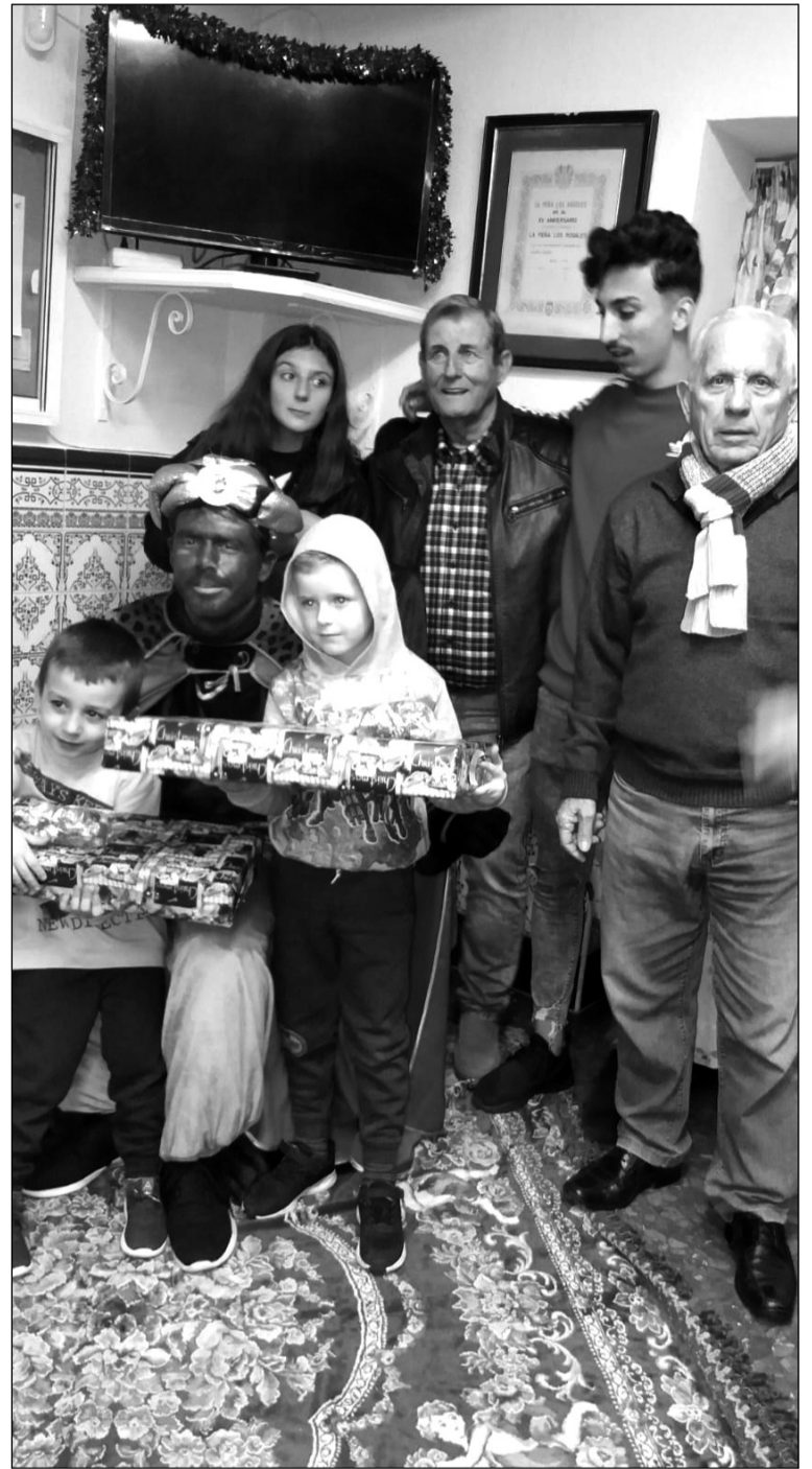
El Rey Baltasar estuvo tanto con los niños como con los mayores.