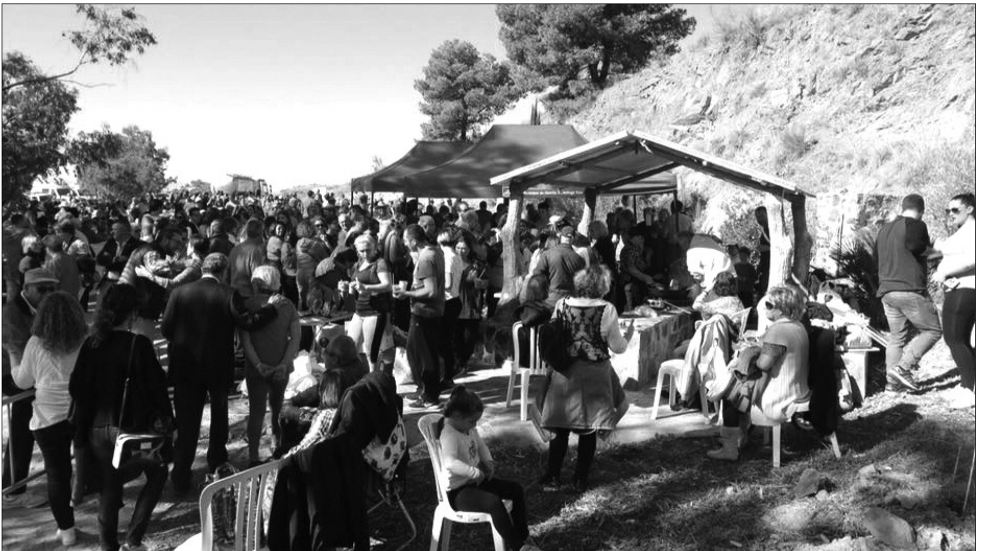
Las entidades peñesas acordaron la suspensión de la edición 2019 de la Romería de San Antón.