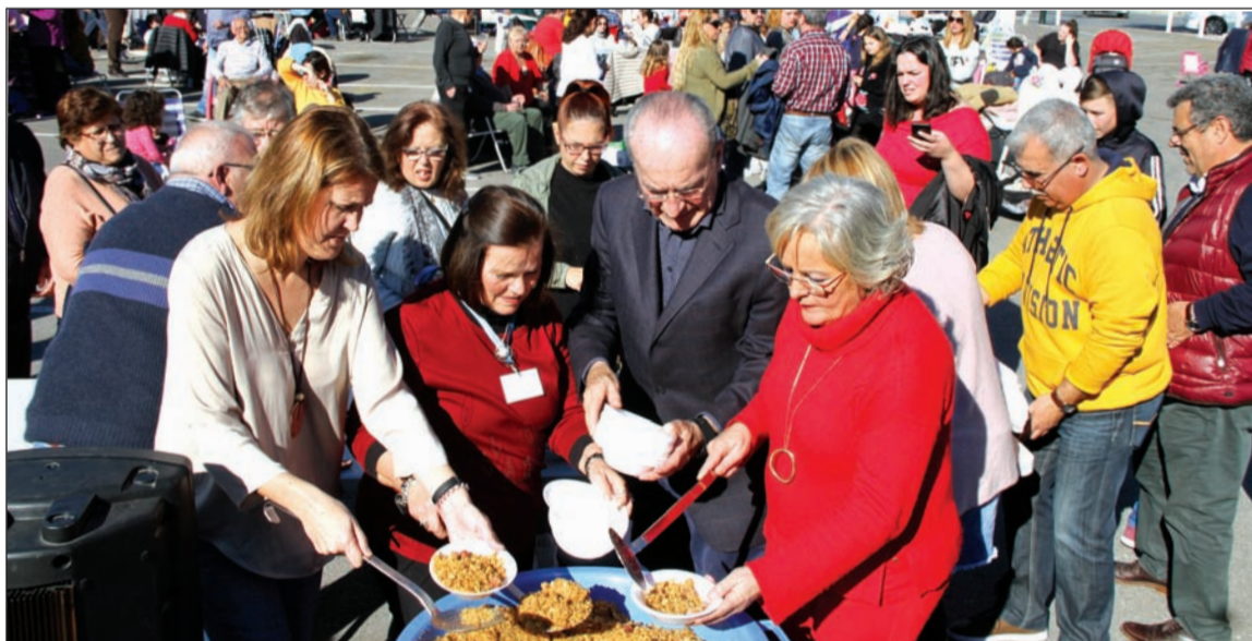
Reparto de migas entre los cientos de asistentes.