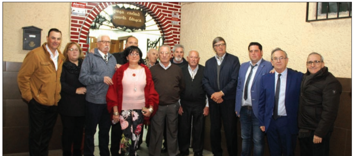
La segunda preliminar tenía lugar el pasado sábado 19 de enero.