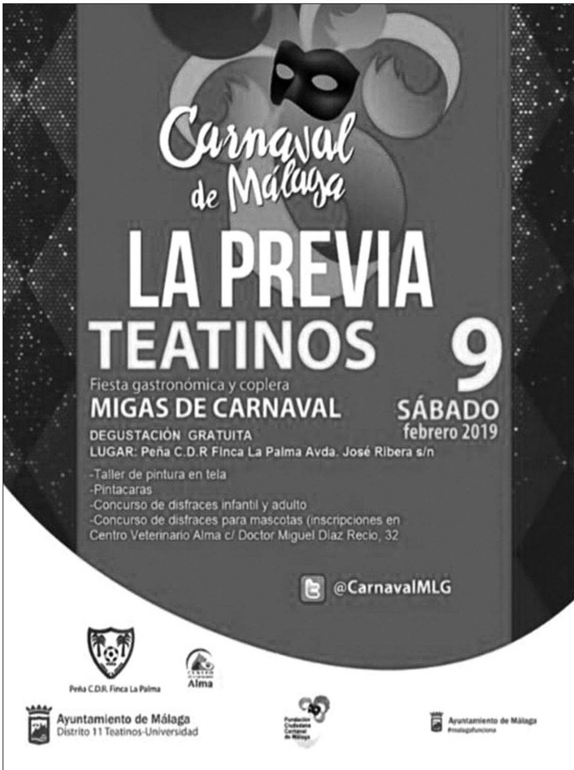
Cartel de las Migas de Carnaval.