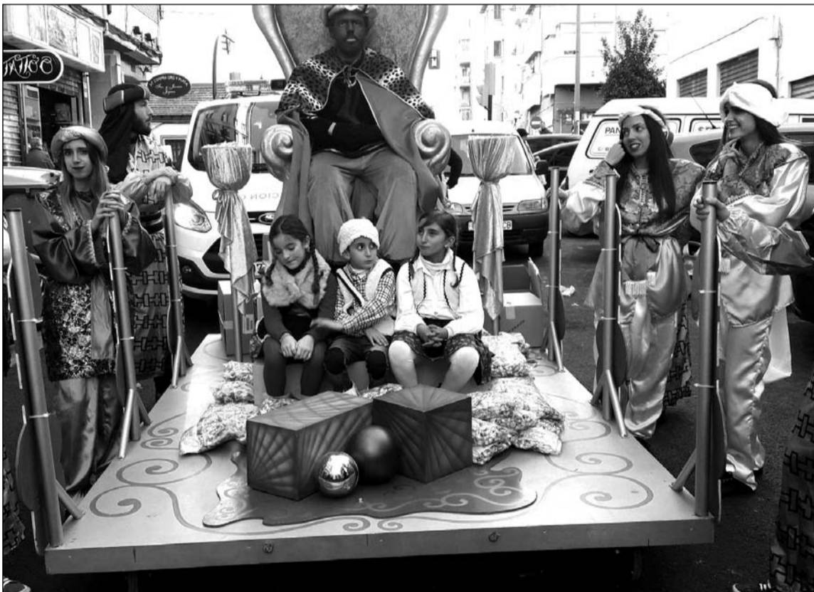
El Rey Baltasar, en la cabalgata de Bailén Miraflores.

Así, como cada año, no faltó la visita del Rey Mago que pasaba unos instantes con los socios de esta entidad federada y que hacía vivir a los más pequeños unos momentos inolvidables con la entrega de regalos.