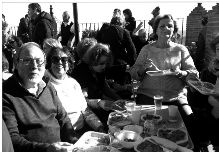
Los socios, entre ellos su presidente, disfrutaron de las fiestas de Comares.

Sin cesar en esta actividad, la Peña Perchelero programaba una nueva salida para el siguiente fin de semana, en este caso hasta Alhaurín de la Torre, municipio que también festejaba el día de su patrón San Sebastián.