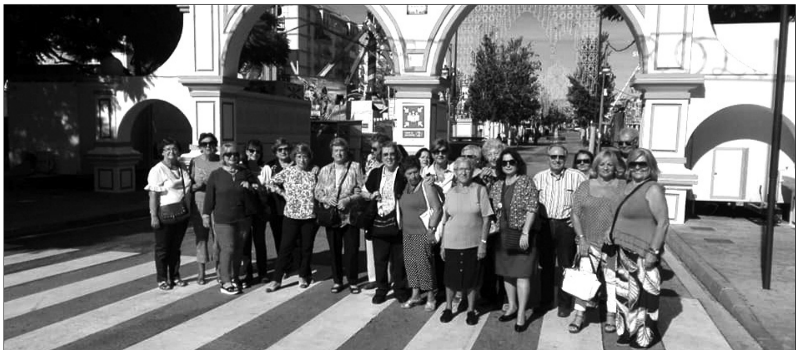
Miembros de la entidad en la portada del recinto ferial de Fuengirola.