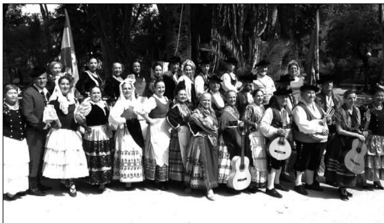
Componentes de la entidad.