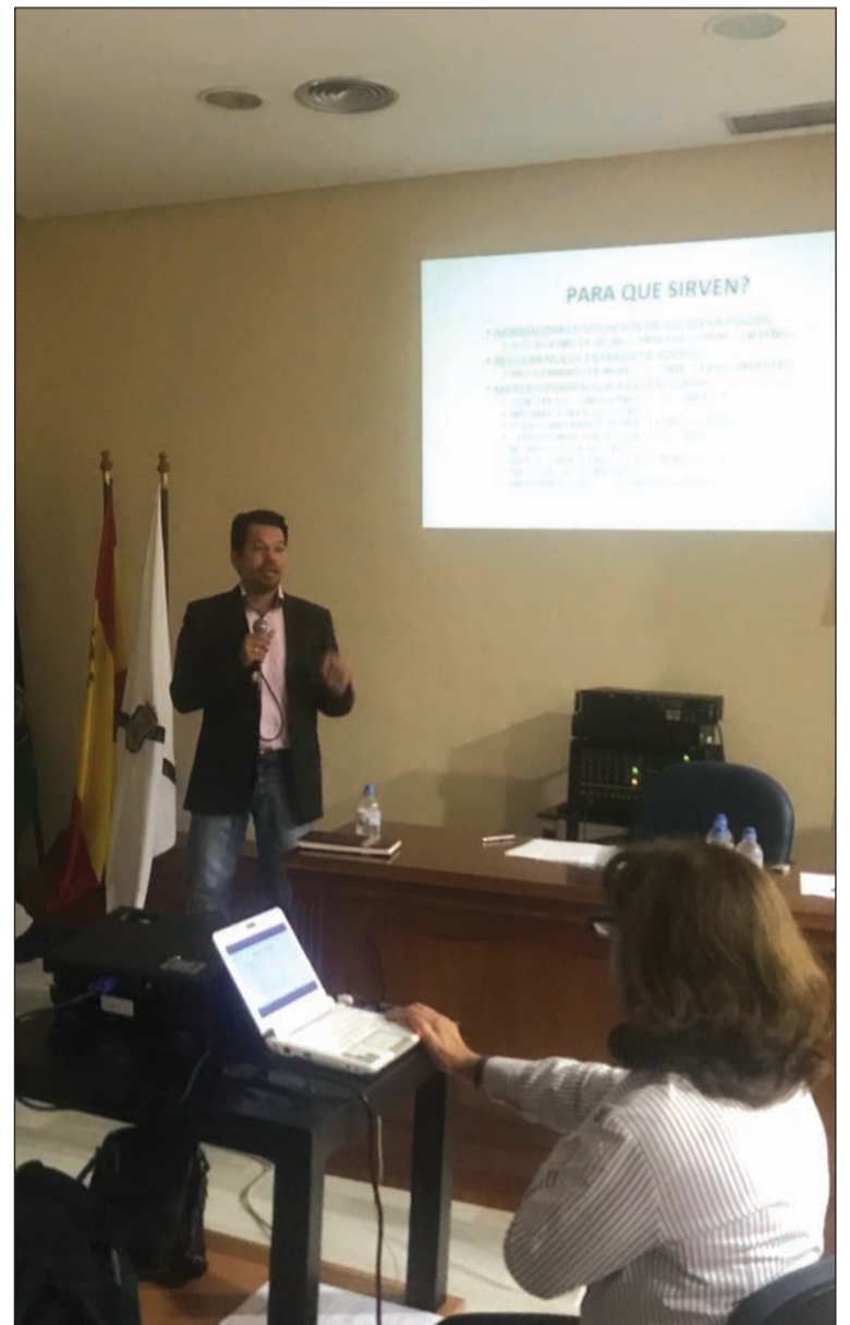
Un instante de la exposición del borrador de los estatutos.

Hay cosas que son exclusivamente malagueñas