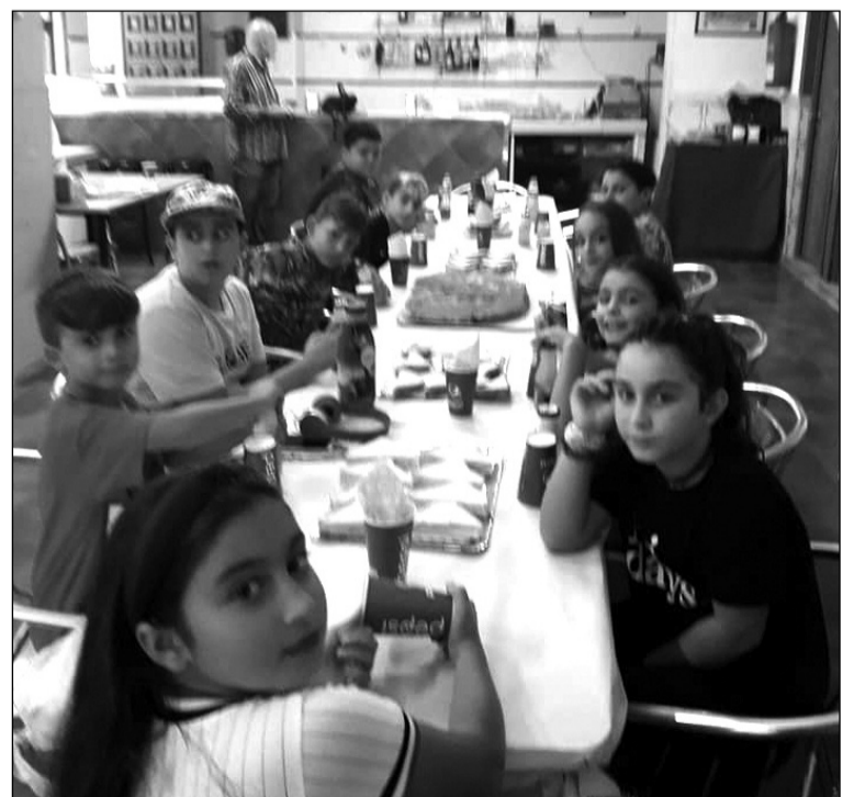
Los pequeños disfrutaron en su merienda en la peña.