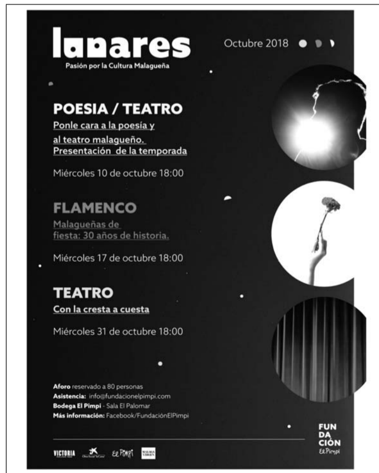
Cartel del ciclo de cultura malagueña.