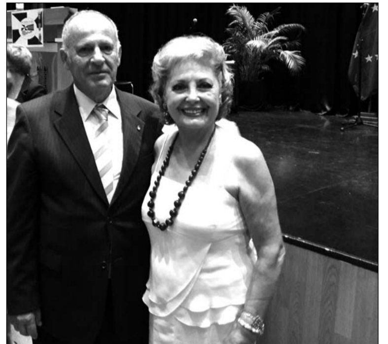
La presidenta Pepi Gil, con el presidente de la Casa de Ceuta en el día de la ciudad.