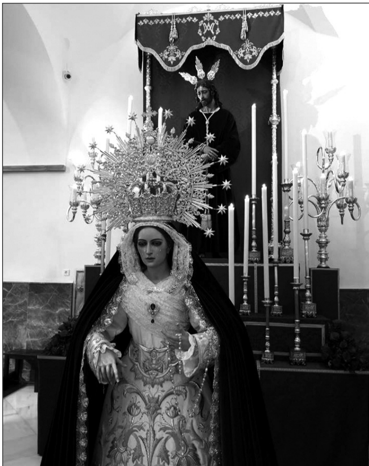
Altar de cultos de la hermandad capuchinera.