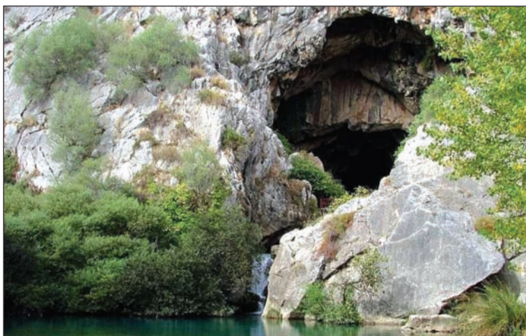
Imagen de la Cueva del Gato, en Benaolán.

La monumentalidad de la Ciudad de Ronda, la riqueza natural de la Cueva del Gato, o la singularidad turística de Puerto Banús se convierten en los tres ejes de esta variada excursión que recorrerá tanto puntos enclavados en la Serranía de Ronda como en Marbella.