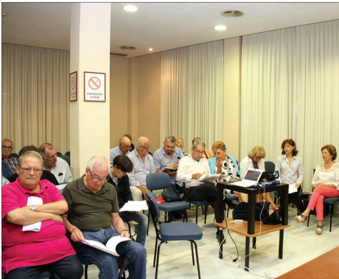
Se entregó a cada uno de los asistentes un borrador de los nuevos estatutos para su estudio en cada entidad.

Número 660 17 de Octubre de 2018 C/ Pedro Molina, 1 Tfno: 952 22 54 39 Fax: 952 21 48 82 E-mail: prensa@femape.com - fmpalcazaba@gmail.com Web: www.femape.com Edición digital: www.femape.com/laalcazabadigital Twitter: @FMPLaAlcazaba Facebook: www.facebook.com/FMPLaAlcazaba