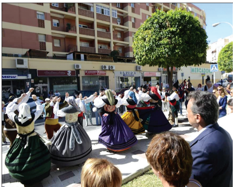
Muestra de folclore asturiano en Torremolinos.