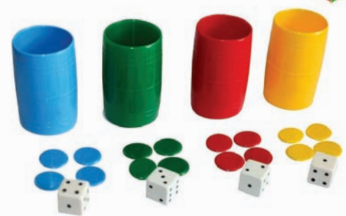
Detalle del cartel de esta actividad.