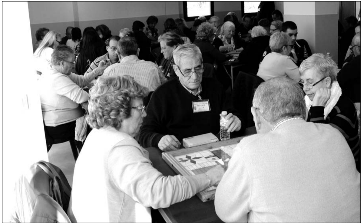
Disputa de las partidas de Parchís en una edición anterior.

• Cuando un jugador haya matado a otra ficha de los tres jugadores restantes, es decir, incluyendo las de su compañero, deberá contar 20 tantos (20 casillas); y si ha sido con el número 6 tirará otra vez.