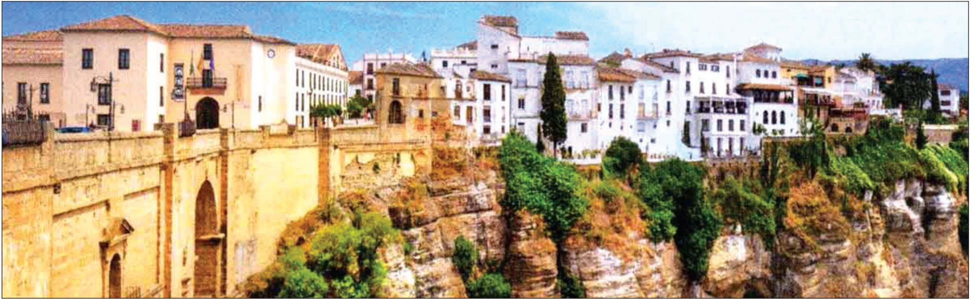
Vista de la Ciudad de Ronda, desde el Puente Nuevo.