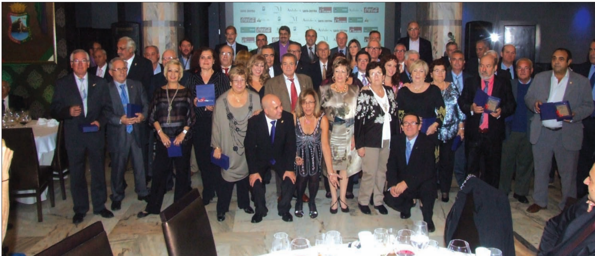
Imagen de archivo de un aniversario de la Federación, con la presencia de representantes de las entidades.