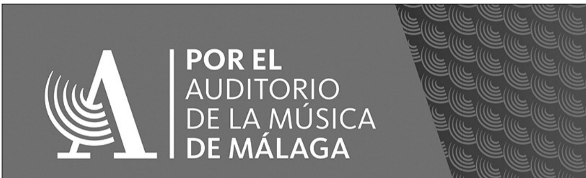
Logotipo de la Plataforma 'Por el Auditorio de la Música de Málaga'

Todos los interesados en asistir a la gala podrán retirar sus invitaciones en la propia sede de la Federación Malagueña de Peñas, en la Calle Pedro Molina 1, de lunes a viernes en horario de 10 a 13 horas.