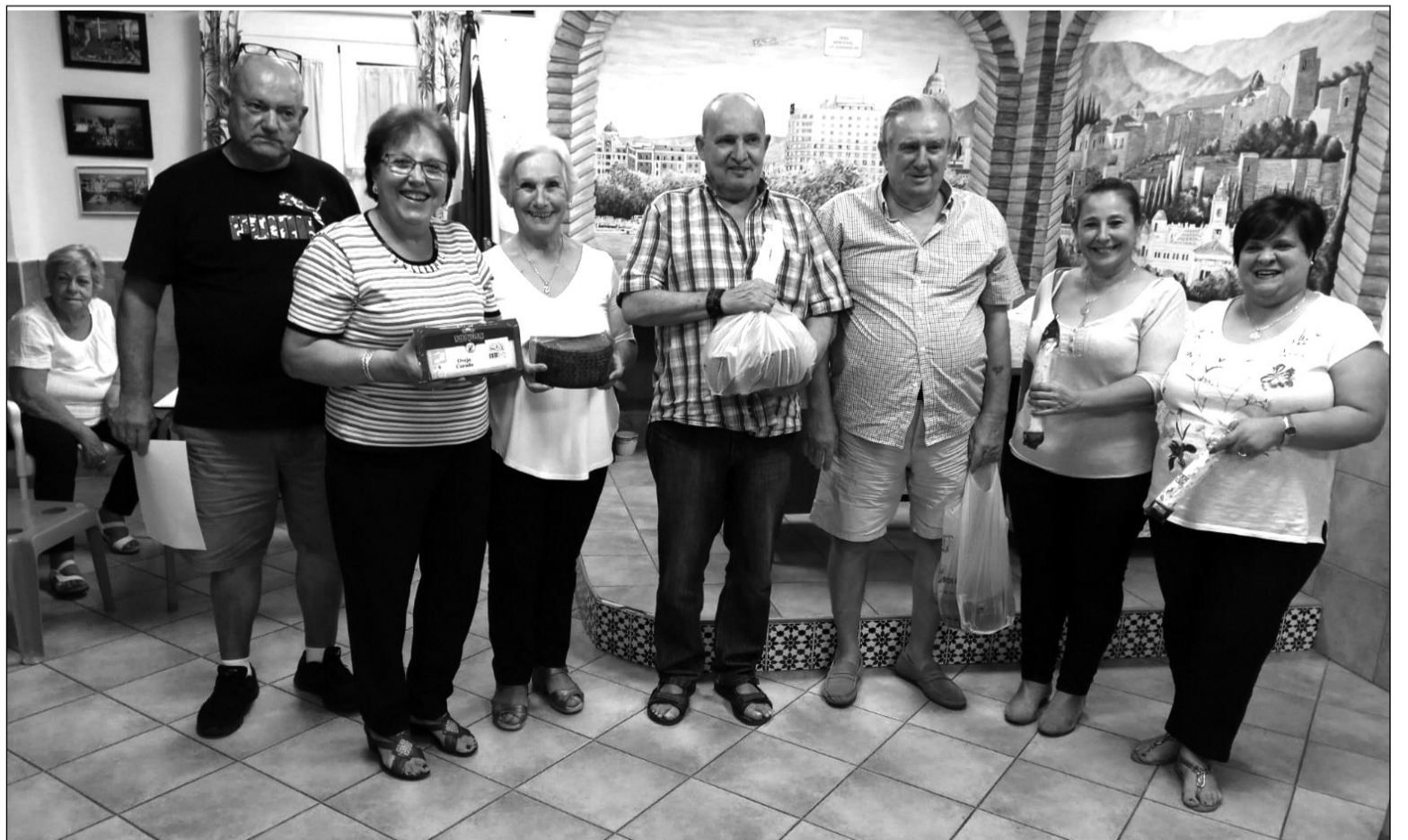
Acto de entrega de premios a las parejas ganadoras del torneo.