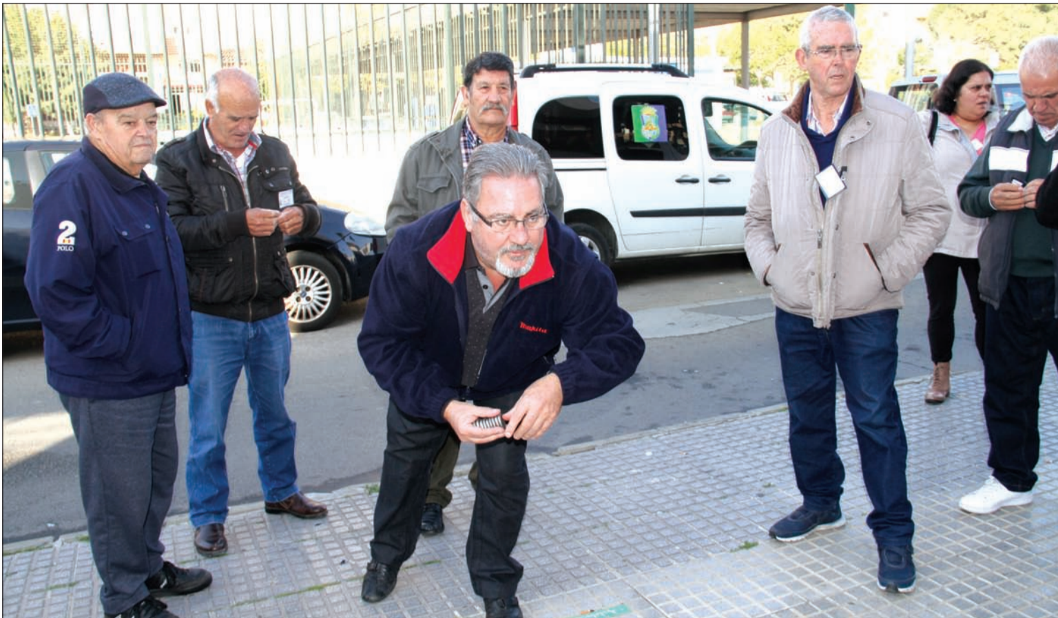
Imagen de la competición de Rana durante las Olimpiadas de Juegos de Peñas de 2017.