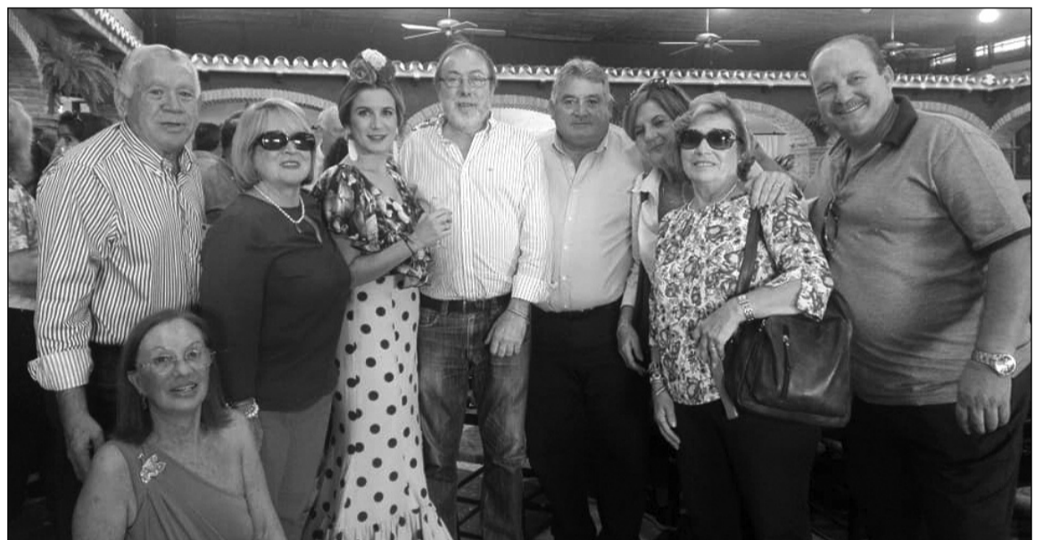
La Peña Perchelera se hermanó con la Peña Coliflor Cucu de Fuengirola hace 22 años.

No faltó tampoco la música en directo e incluso el baile por el que se arrancaron algunos de los componentes de la peña.