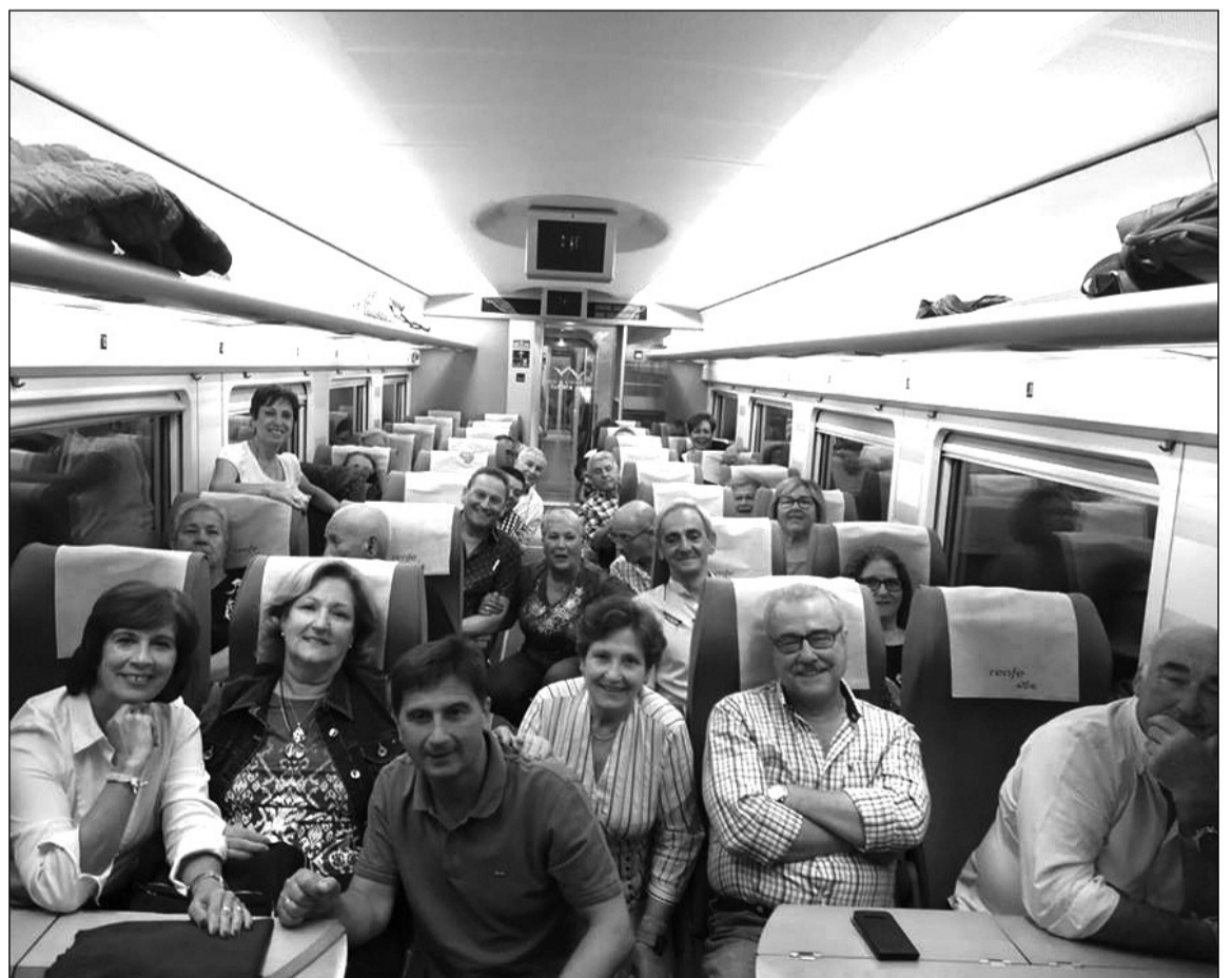
Socios de El Palustre en el AVE rumbo a Madrid para comenzar su ruta hasta Galicia.

Esta excursión tenía lugar tras unos meses especialmente intensos para la Peña El Palustre, que ha participado en acontecimientos tradicionales como las Fiestas Deportivas y Marineras en Honor de la Virgen del Carmen, en las que un año más instalaron una caseta en la plaza del Padre Ciganda, o la celebración de su tradicional Concurso Nacional de Albañilería que tenía lugar en esa misma emblemática ubicación en el paseo marítimo de este barrio.