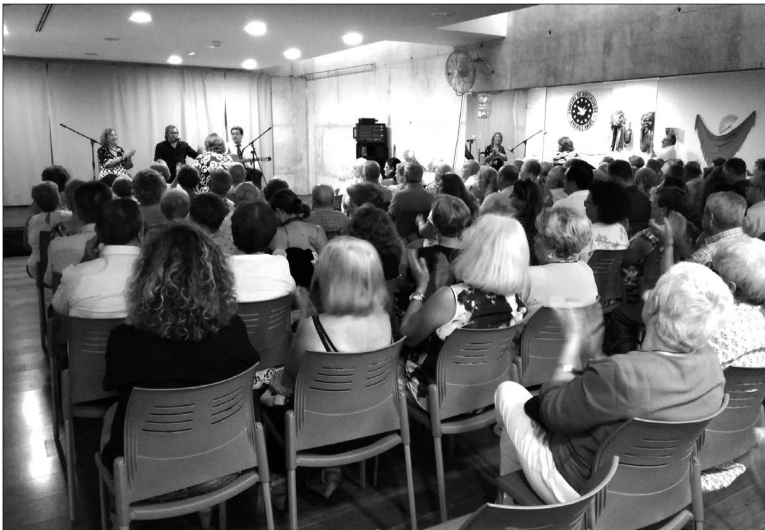
Aspecto que presentaba el salón durante la actuación.