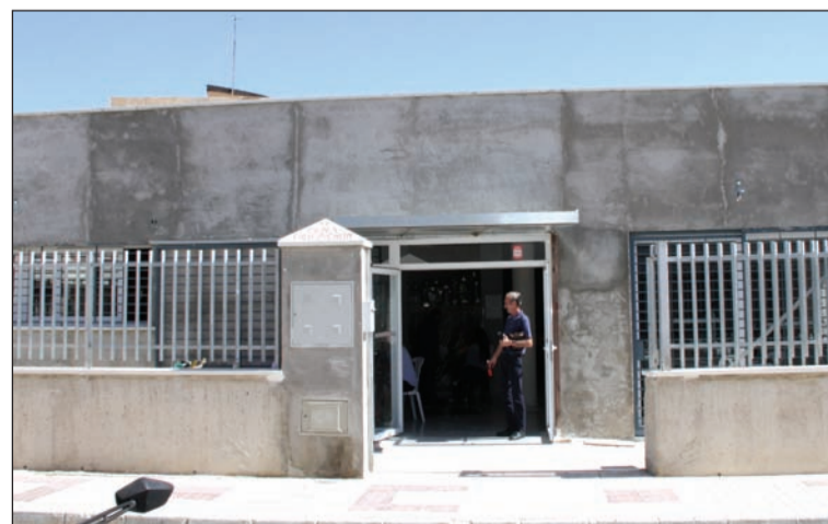
Tras concluir la obra interior, ya sólo resta enlucir la fachada.