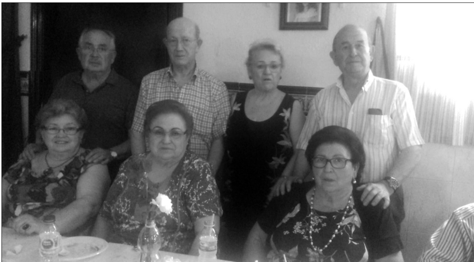
Algunos de los participantes en esta actividad.

El cariño ofrecido en esta actividad fue respondido con una gran participación y sobre todo un inmejorable ambiente.