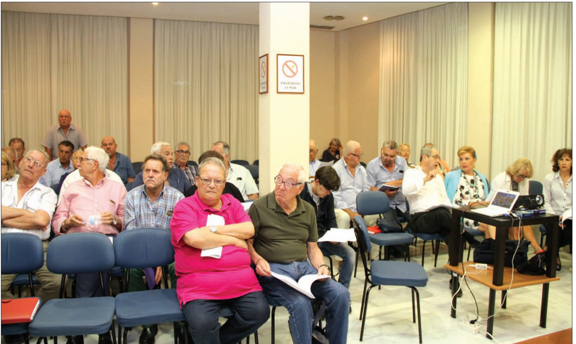
Asistentes a la reunión informativa instantes antes de su inicio.

para aprobar los estatutos. No obstante, advirtió que “en cualquier caso a principios del próximo año, una vez que se cierren las cuentas de este colectivo, se convocarán las elecciones”.