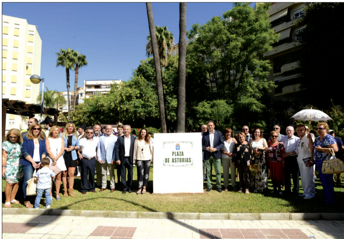
Acto de inauguración de la Plaza de Asturias de Torremolinos.