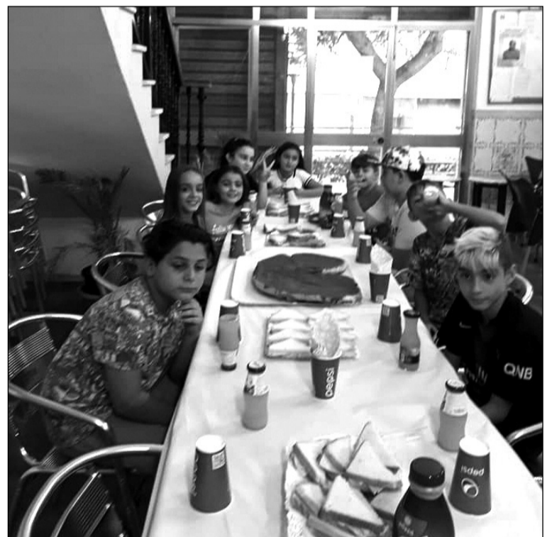
Niños merendando en la sede de la entidad.

Actividades como esta ponen de relieve el carácter familiar de las entidades que conforman el colectivo peñista malagueño, y que está integrado por personas de todas las edades.