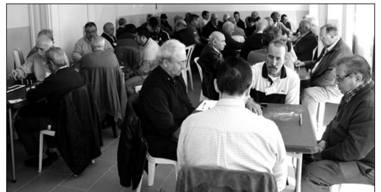
Competición de Dominó en unas Olimpiadas de Juegos de Peñas.