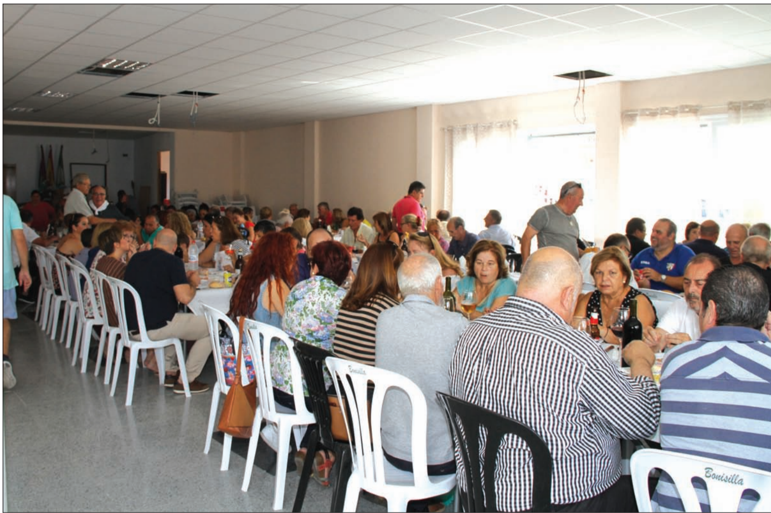
Los socios acudieron de forma masiva a la inauguración de la nueva sede.