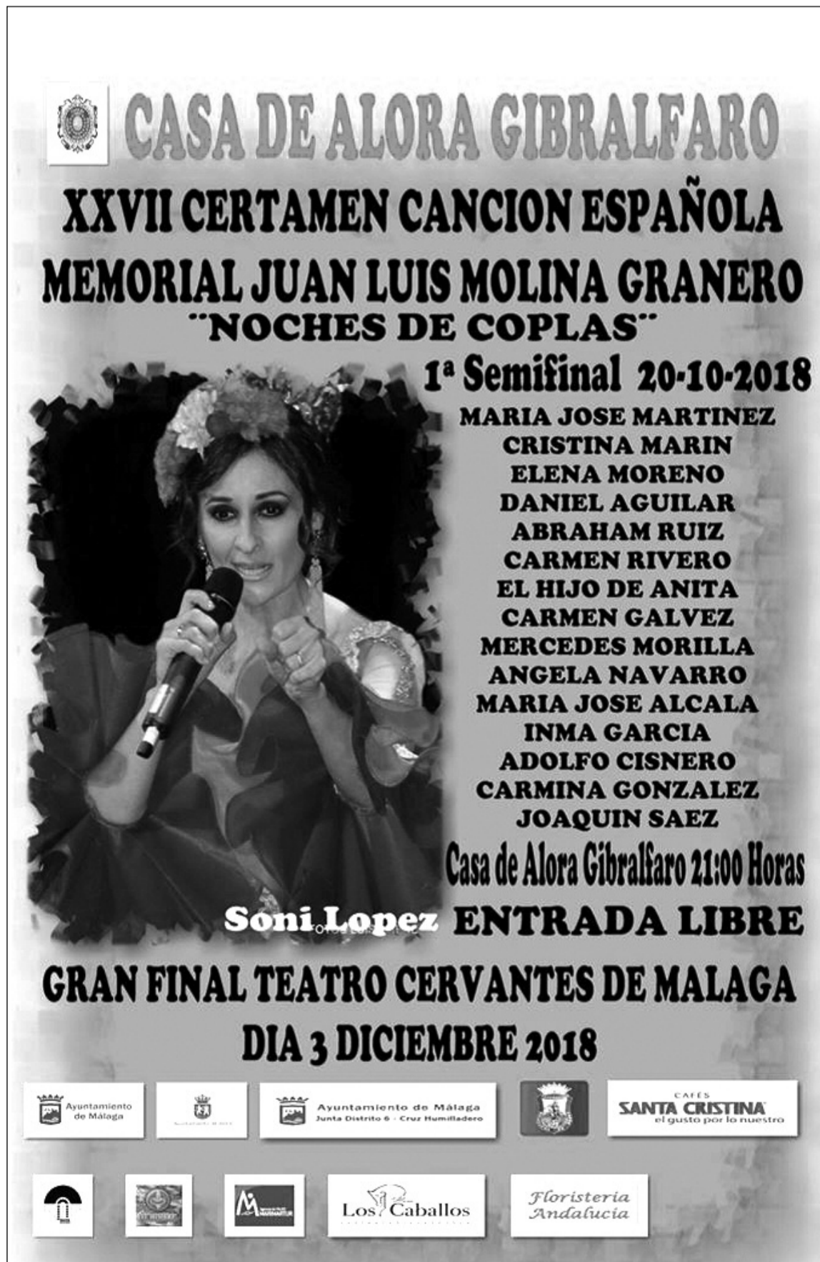
Cartel de la primera semifinal.

En lo que respecta a los premios, para el primer clasificado se reservan 2.000 euros, un trofeo y una composición inédita por gentileza de Bahía Records (Rafael Castro); mientras que el segundo obtendrá 800 euros y trofeos. Además, se concederán tres terceros premios de 300 euros y trofeo.