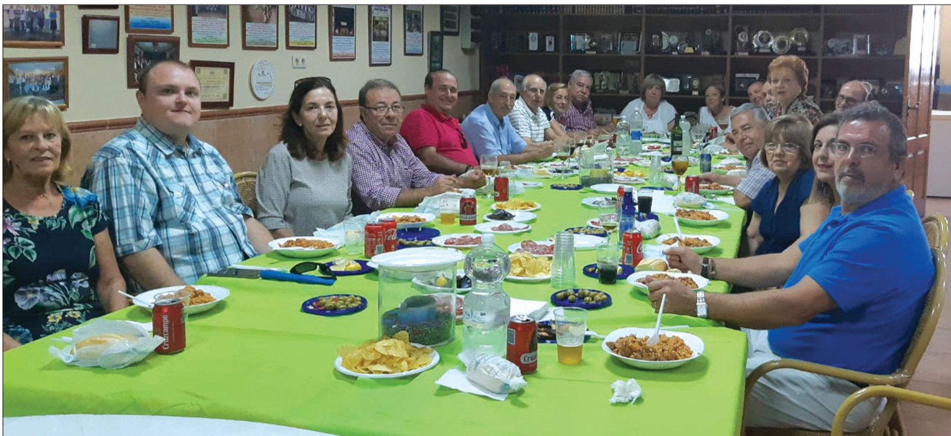
Presidentes asistentes a esta comida organizada por la presidenta del Centro Cultural Renfe.

Además, estos almuerzos de presidentes sirven para reforzar la hermandad entre las diferentes entidades que conforman la Federación Malagueña de Peñas, y que realizan a lo largo del año diversas actividades de un modo conjunto dentro de su programación tradicional.