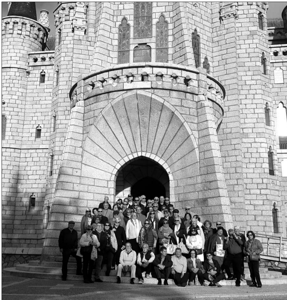
Socios de la entidad ante el Palacio Episcopal de Astorga.

Intenso viaje y en cuyo recorrido se empezó a fraguar el del próximo año.