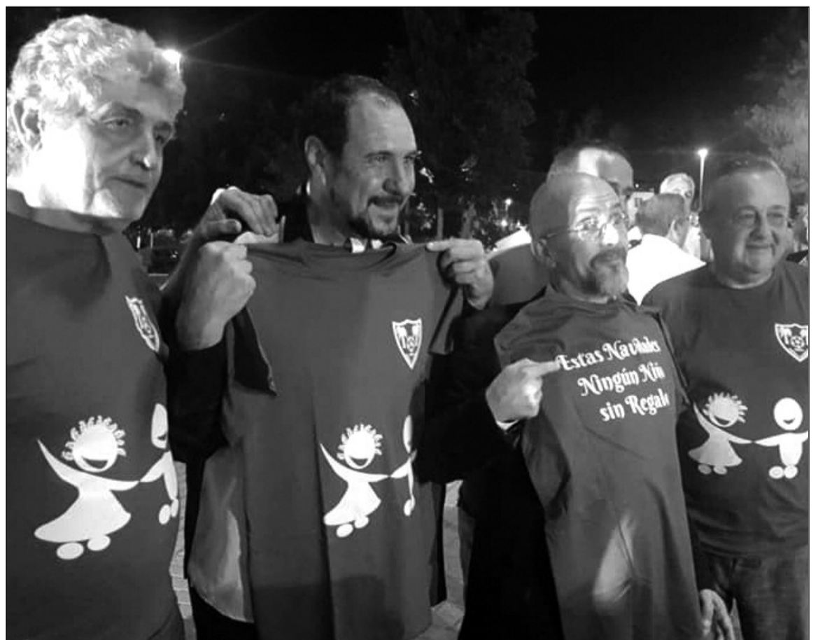
Los humoristas se unieron a la campaña solidaria.