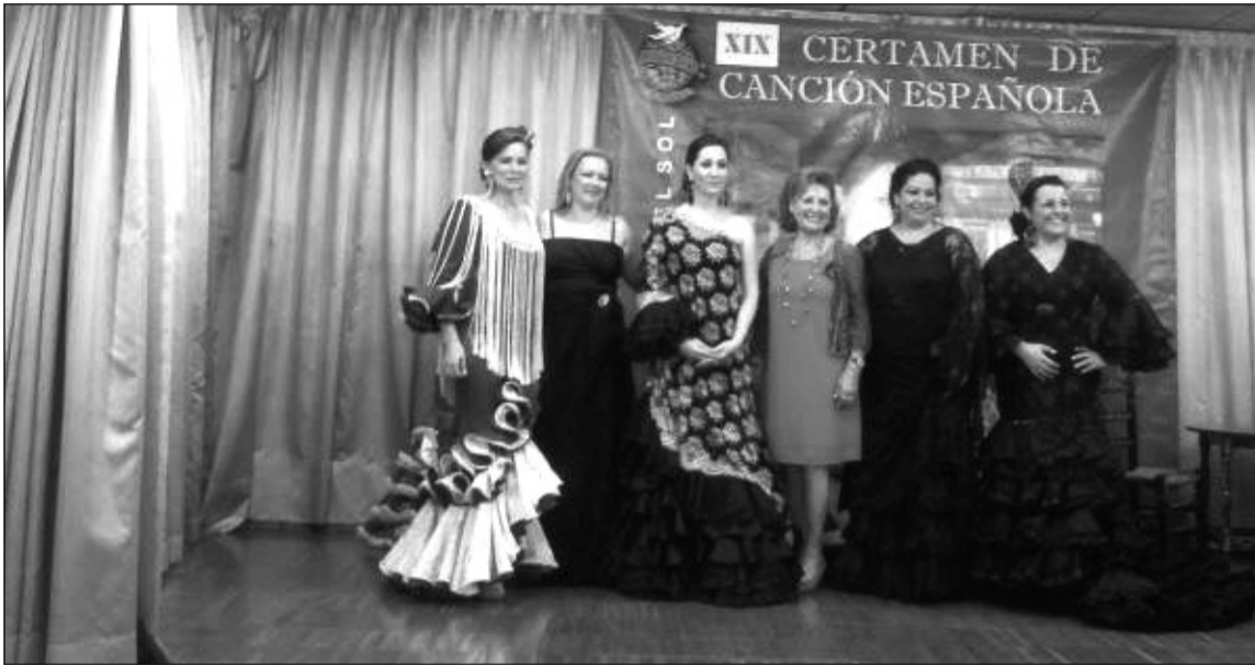
Imagen de archivo de una semifinal del certamen en la sede de la entidad.

El XXV Certamen de Canción Española 'Costa del Sol' promete emociones fuertes, ya que por él pasarán algunos de los mejores intérpretes de copla de toda Andalucía.