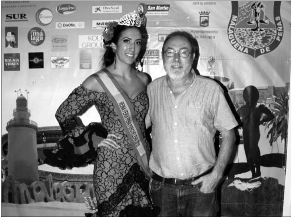
El presidente de la Peña Perchelera, con la Reina de su entidad.