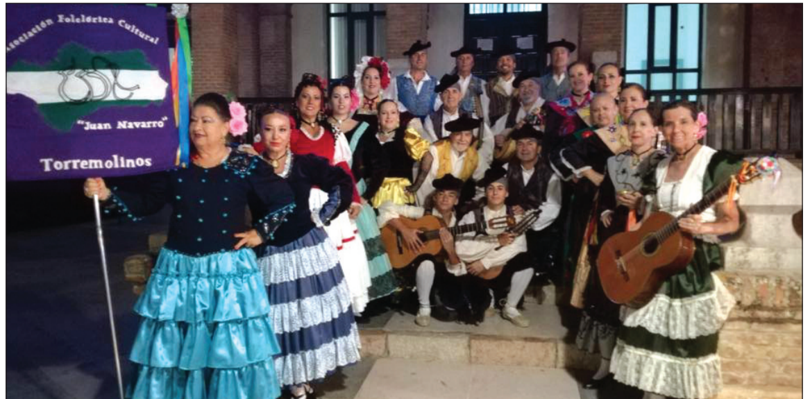
Componentes del grupo en Campillos.

Por otra parte, desde la Asociación Folclórica Cultural Juan Navarro se comunica que en este mes de septiembre se iniciarán en su sede de la Avenida Carlota Alessandrini de Torremolinos las clases de baile para niños y niñas, que de este modo aprenderán verdiales, jotas, fandangos, sevillanas, entre otros.