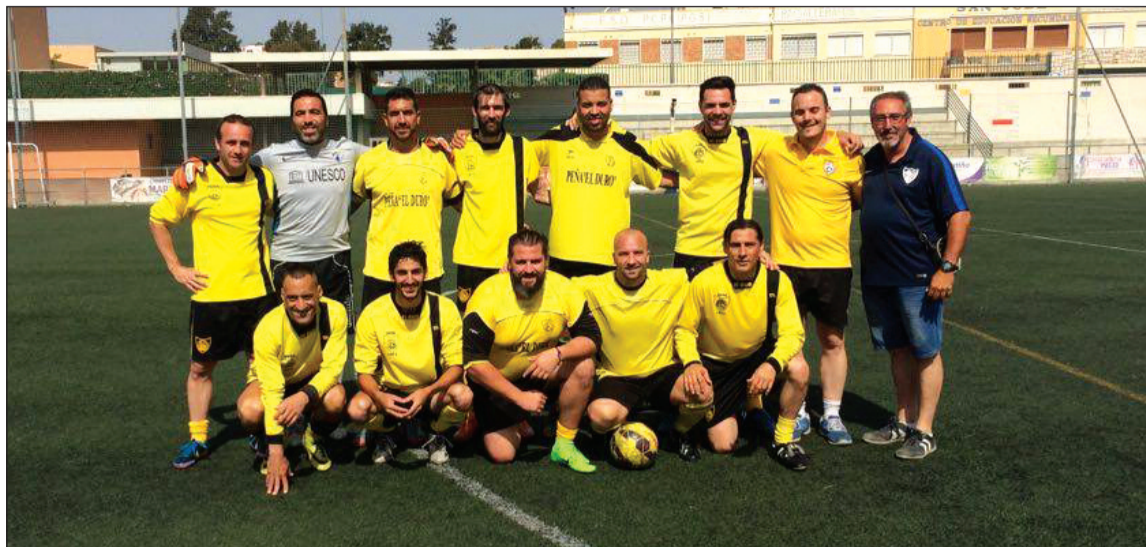
Equipo ganador del tercer torneo de la pasada temporada.

Este primer torneo se prolongará hasta llegar a Navidad, de modo que las semifinales están programadas para el 16 de diciembre y la gran final para el 23 de ese mismo mes.