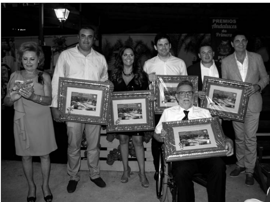
Entrega de galardones de los Premios Andaluces de Primera de la Peña La Paz.