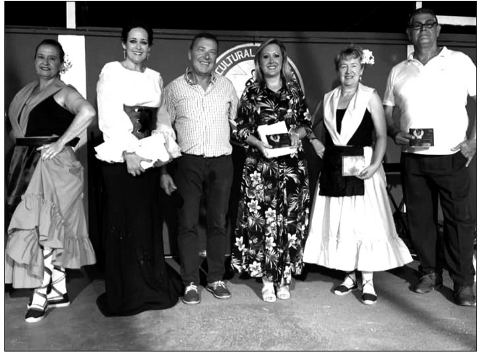
Entrega de recuerdos en el Certamen de Malagueñas del Centro Cultural Renfe.