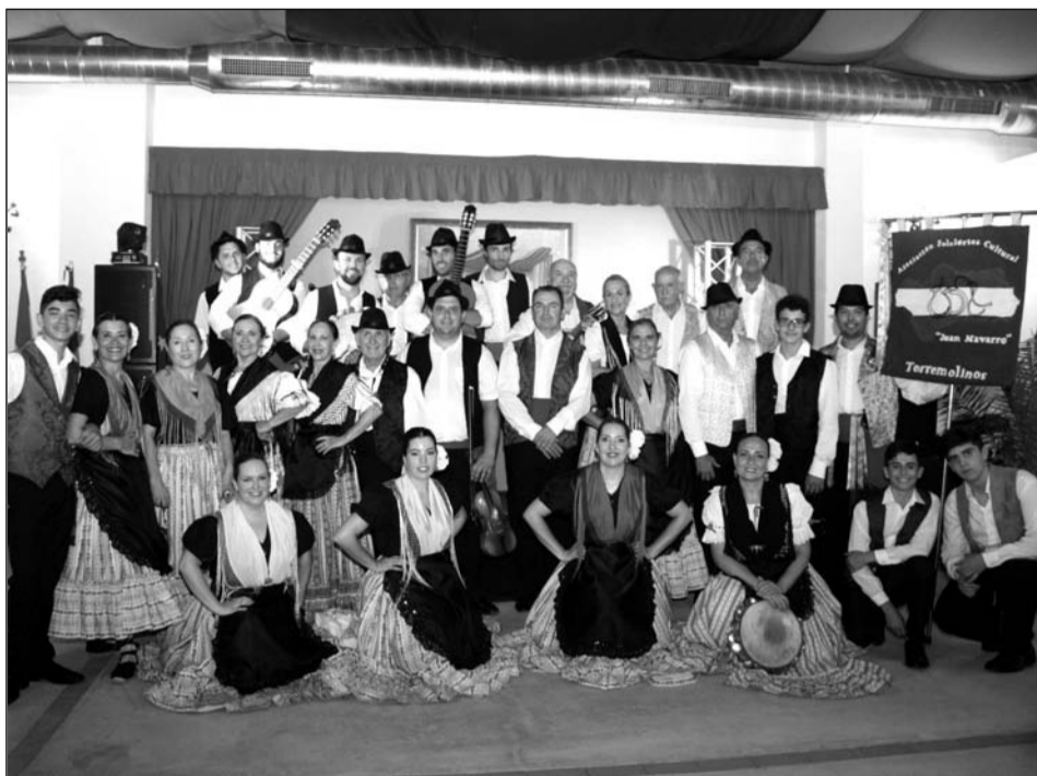
Asociación Folclórico Cultural Juan Navarro de Torremolinos.