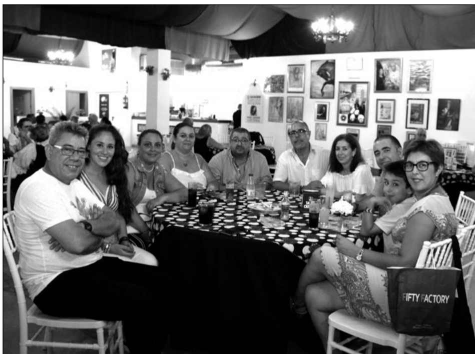
Componentes de la Peña Costa del Sol y la Peña La Biznaga.