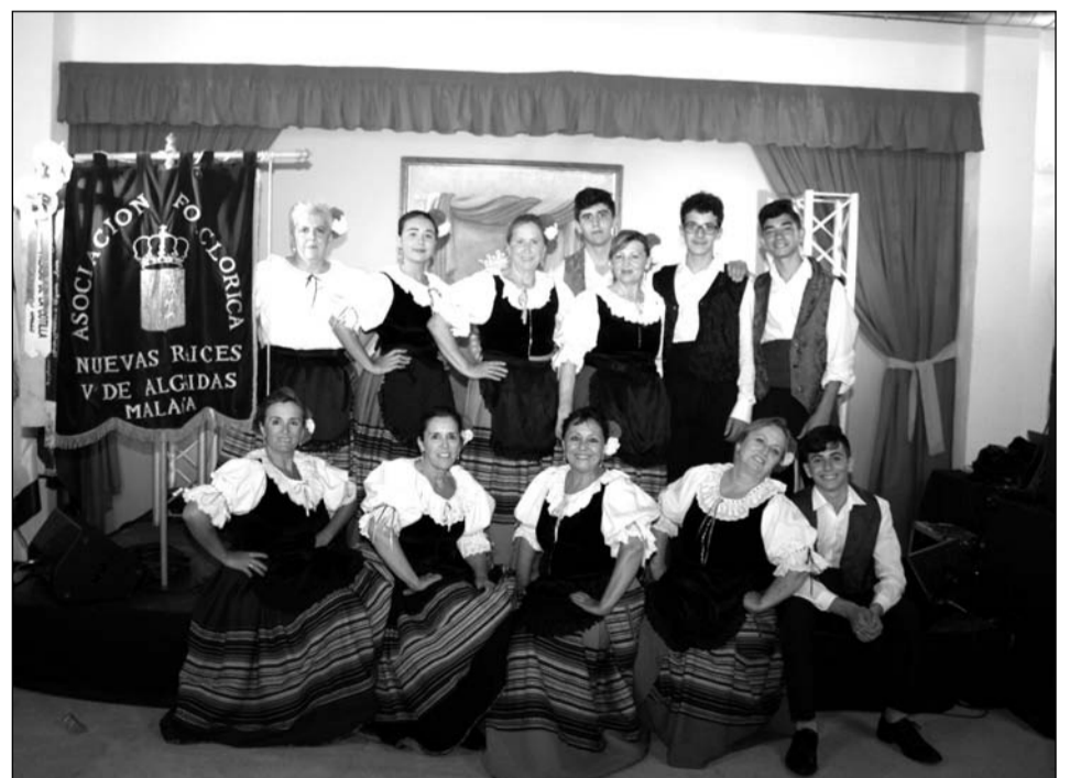
Asociación Folclórica Nuevas Raíces de Villanueva de Algaidas.