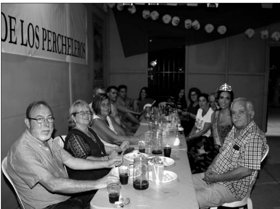
Encuentro de peñistas en la caseta de la Peña Perchelera.