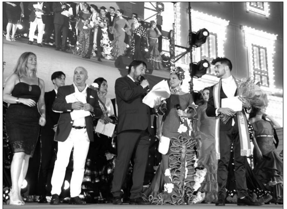
Nombramiento de la Reina de la Feria 2018, una vez designado al Mister.