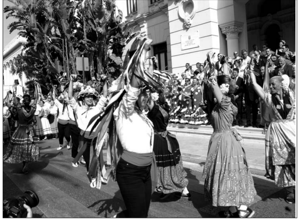
Baile de verdiales en la puerta del Ayuntamiento al comienzo de la Romería.