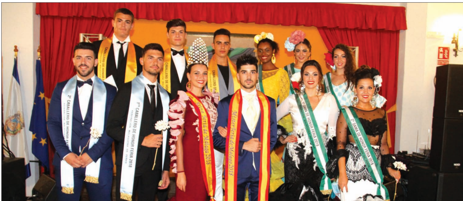
La Reina y el Mister de la Feria 2018, junto a sus Damas y Caballeros de Honor, representarán a la Federación de Peñas en la Ofrenda Floral a la Patrona.