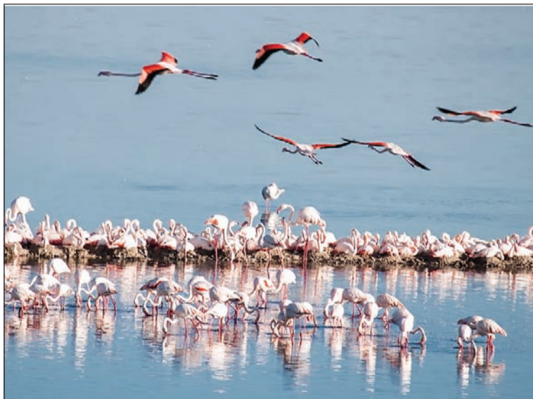
Flamencos en la Laguna de Fuente de Piedra.