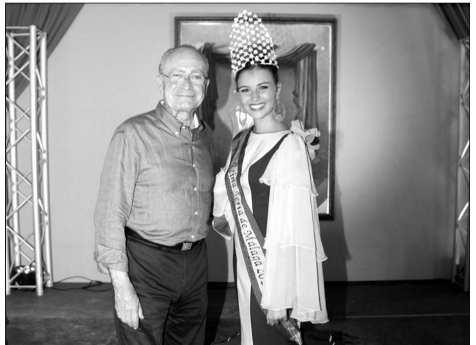
El alcalde, con la Reina de la Feria.