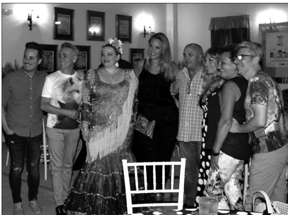
El presidente de la Junta Rectora con cantantes y modistos.