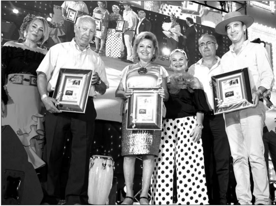
Entrega de premios a las mejores fachadas en el Concurso de Embellecimiento de Casetas.