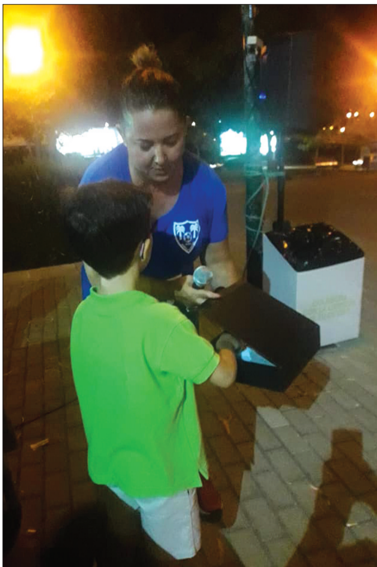
Sorteo realizado entre los asistentes.