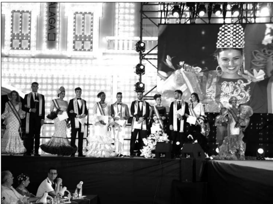
La Reina y el Mister, con sus Damas y Caballeros de Honor en la Portada del Recinto Ferial.