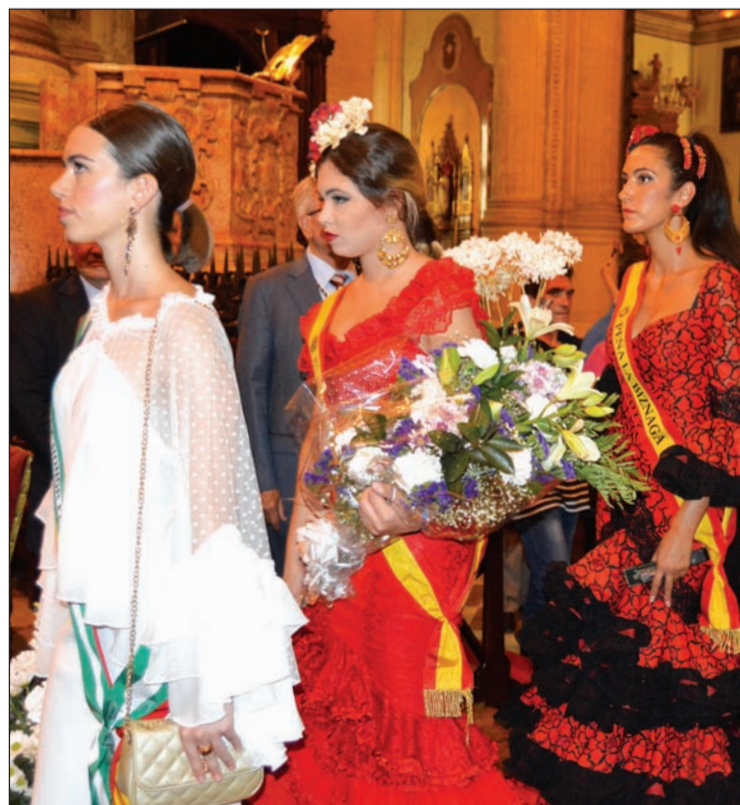
Imagen de la ofrenda floral del pasado año en la Catedral.

El sábado 8 por la tarde se celebrará la tradicional procesión de regreso a su Real Santuario y Basílica, con la participación corporativa de la Federación Malagueña de Peñas y la asistencia nuevamente de la Reina, Mister, Damas y Caballeros de Honor, que aportarán colorido al cortejo cofrade que hará su paso por la calle de la Victoria, donde el colectivo peñista cuenta con su sede social, que como es tradicional será engalanada para la ocasión.