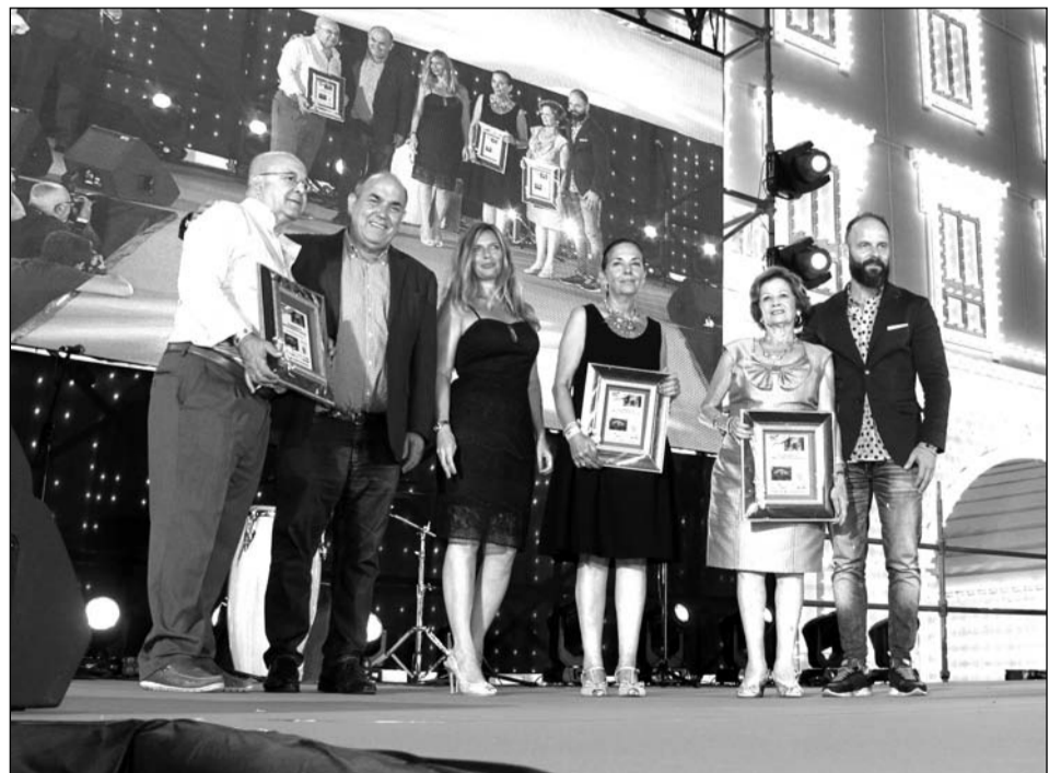
Entrega de premios del Concurso de Embellecimiento de Casetas, en su categoría de interiores.