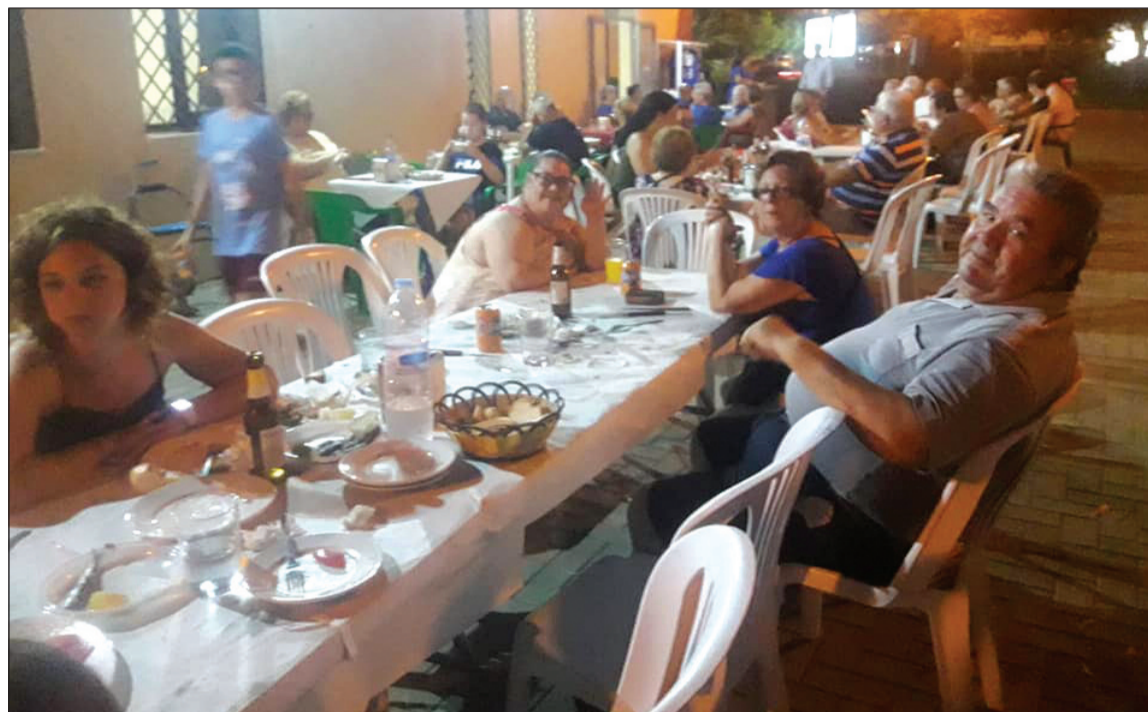
Ambiente en la terraza de la entidad durante la sardinada.