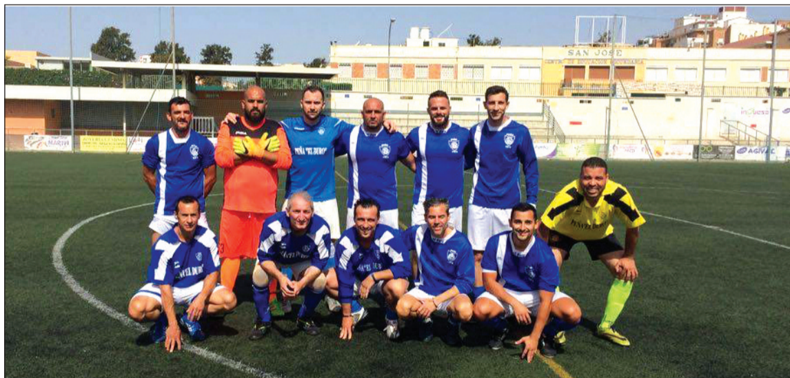
Conjunto finalista en el último torneo disputado.