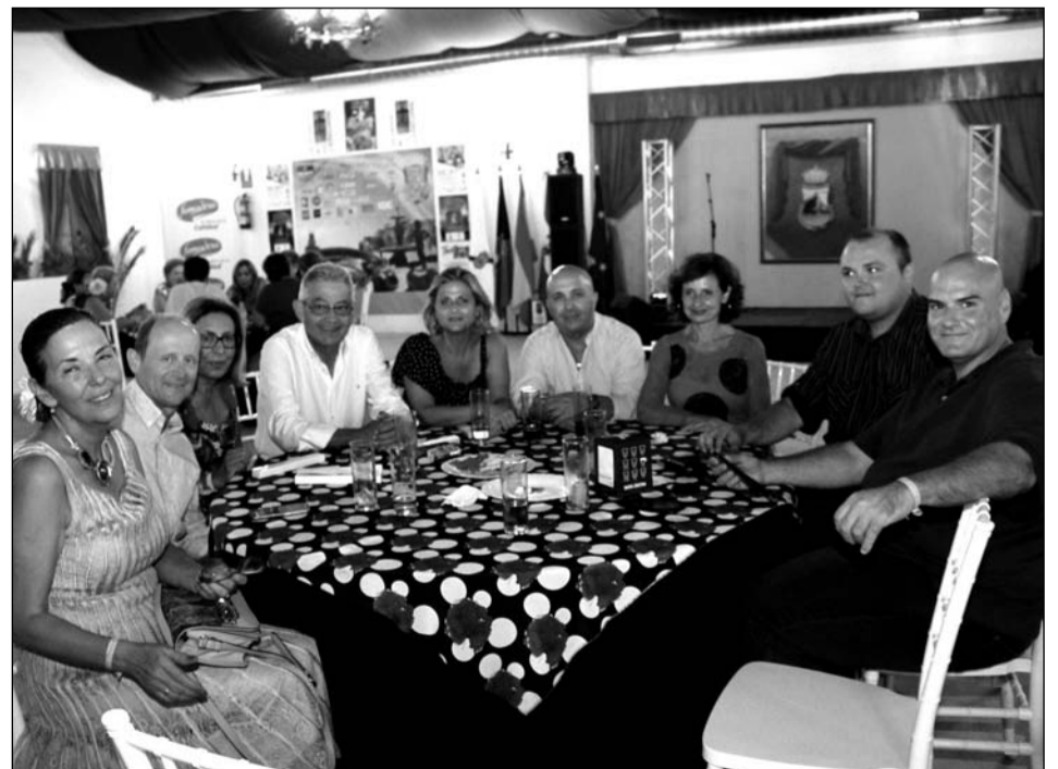
Visita del grupo municipal socialista en el Ayuntamiento de Málaga, con miembros de la Junta Rectora.