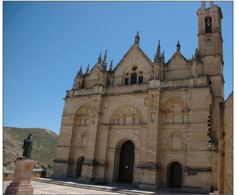
Real Colegiata de Santa María la Mayor.

La visita comenzará en el Paraje Natural de la Laguna de Fuente Piedra, donde se podrán contemplar los flamencos que allí habitan. Posteriormente se desplazarán hasta Antequera para descubrir en primer lugar una joya arquitectónica como es su Real Colegiata y, posteriormente, otro espacio natural de gran riqueza y singularidad como es el Torcal.