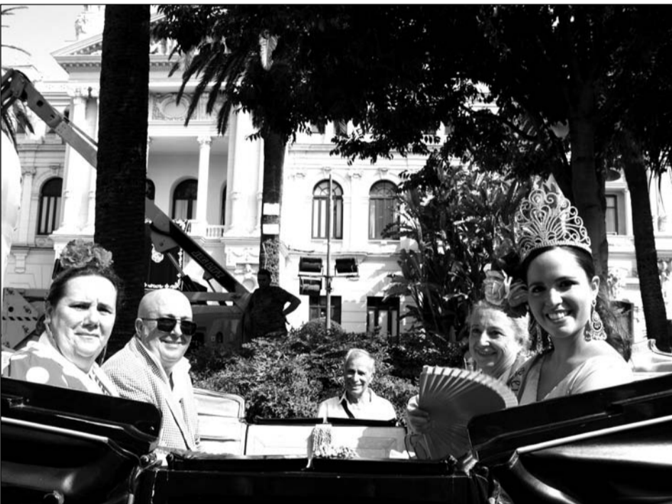
La Federación de Peñas participó en uno de los coches de caballos a la Victoria en la Romería.