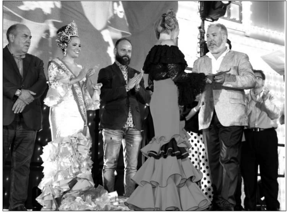
Entrega de recuerdos a los miembros del jurado del Certamen de Reina y Mister.