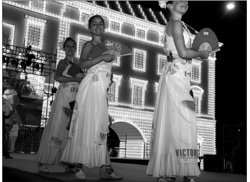
La Charanga de Cerveza Victoria, durante la gala de Elección de la Reina y el Mister.