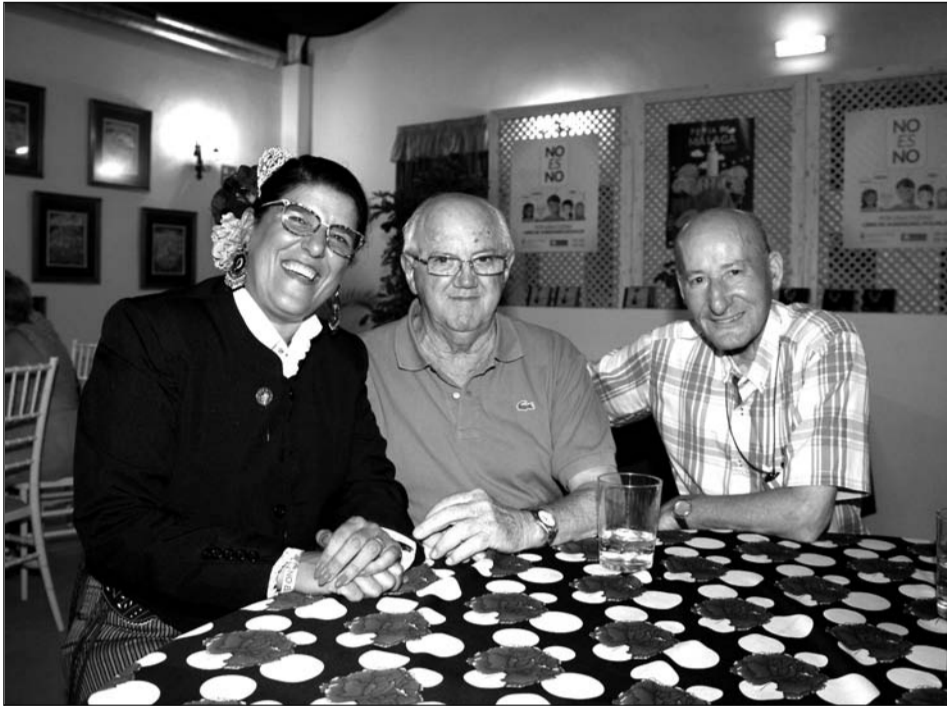
Componentes de distintas entidades como El Sombrero, La Florida y Los Ruisseños.