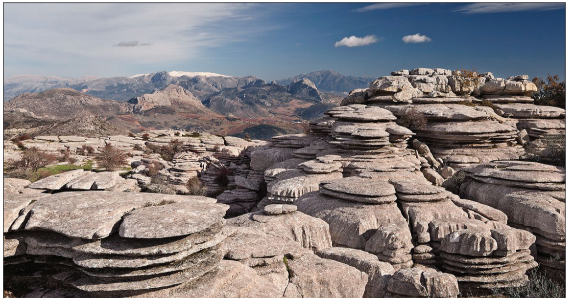
El Torcal de Antequera.

Entidades colaboradoras con esta publicación: