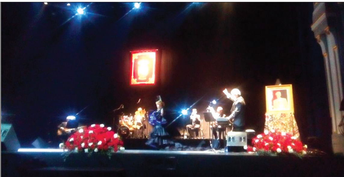
Imagen de la final del pasado año en el Teatro Cervantes.