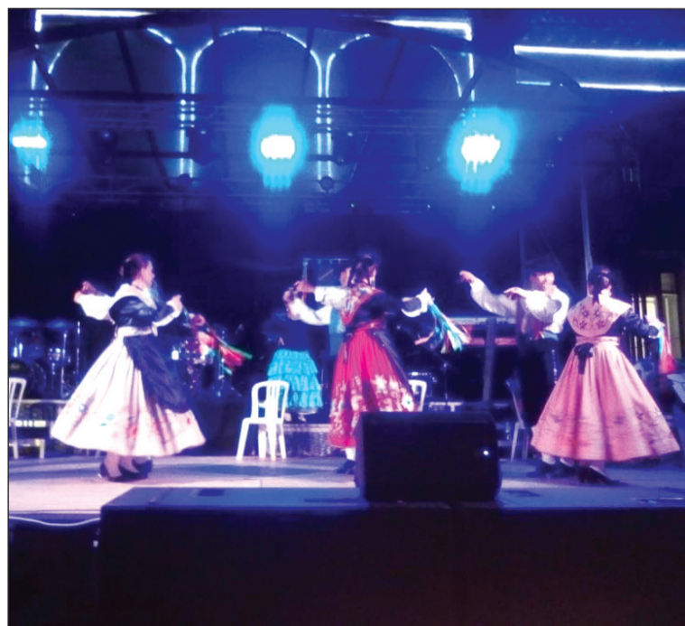
Un instante de la actuación en la Feria de Campillos.