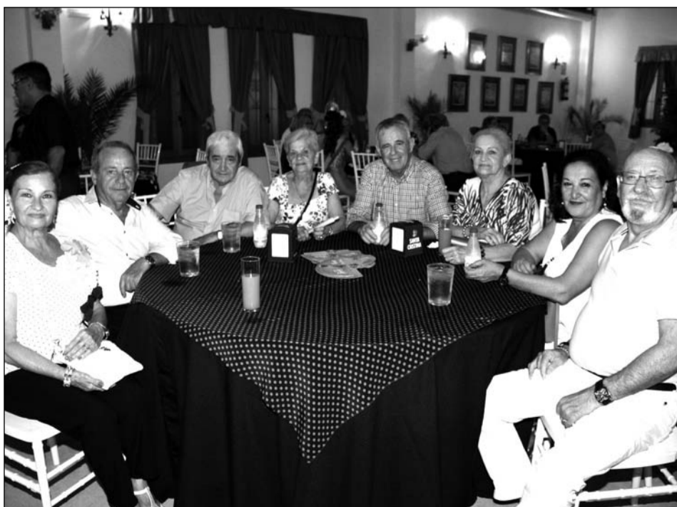
Peñistas visitan la caseta del colectivo en Cortijo de Torres.