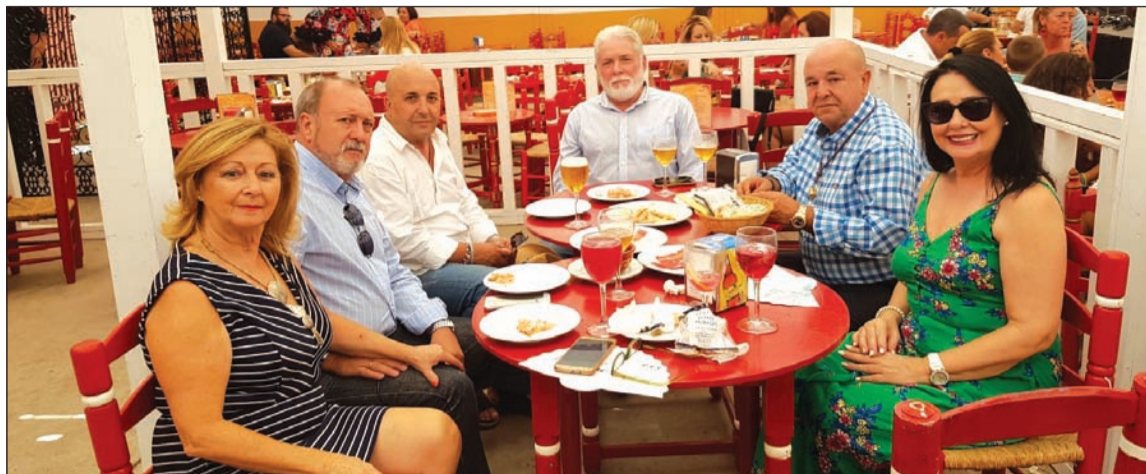
Visita de los representantes de la Federación de Peñas Cordobesas a la caseta de la Peña Los Mimbrales.

Entre las visitas destacadas a la Caseta de Los Mimbrales durante la pasada Feria también se ha encontrado la del alcalde de Málaga Francisco de la Torre y la teniente de alcalde Teresa Porras.