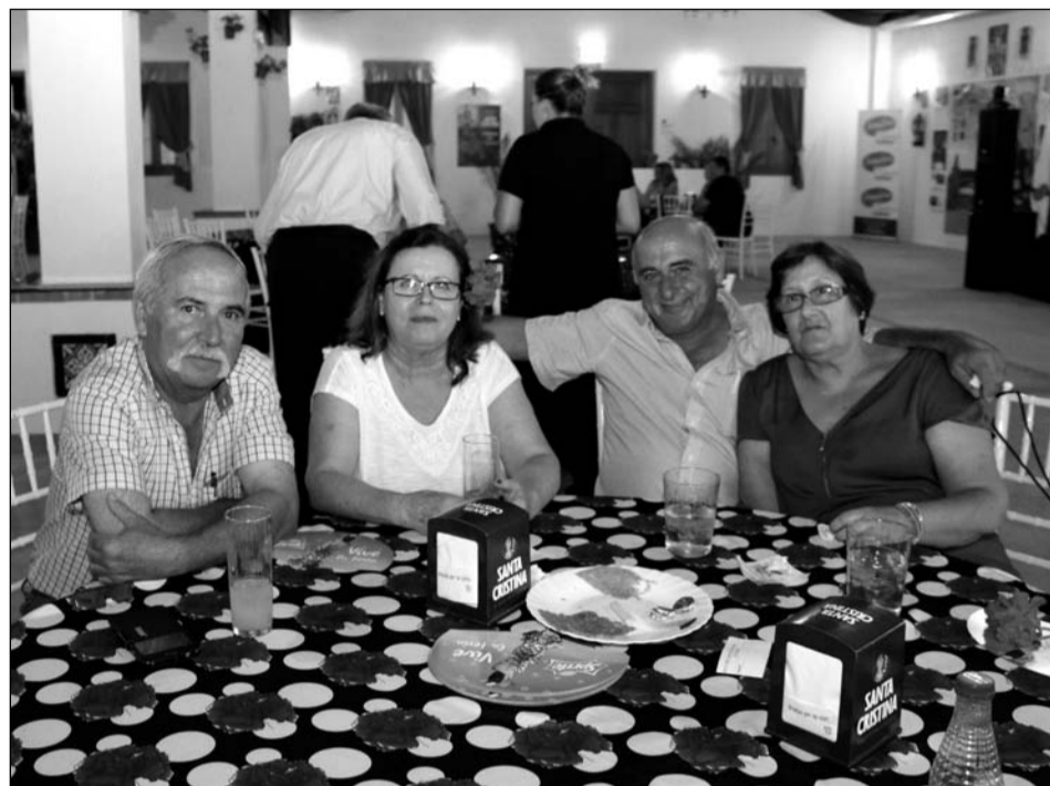
Representantes de la Peña Finca La Palma.