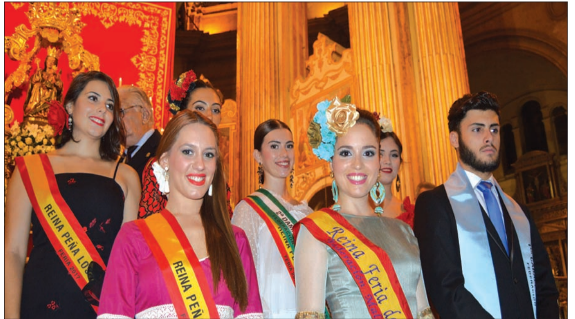
Imagen de archivo de la ofrenda del pasado año.