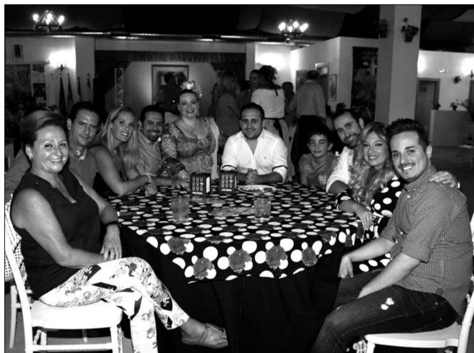
Grupo de artistas en la caseta de La Alcazaba.