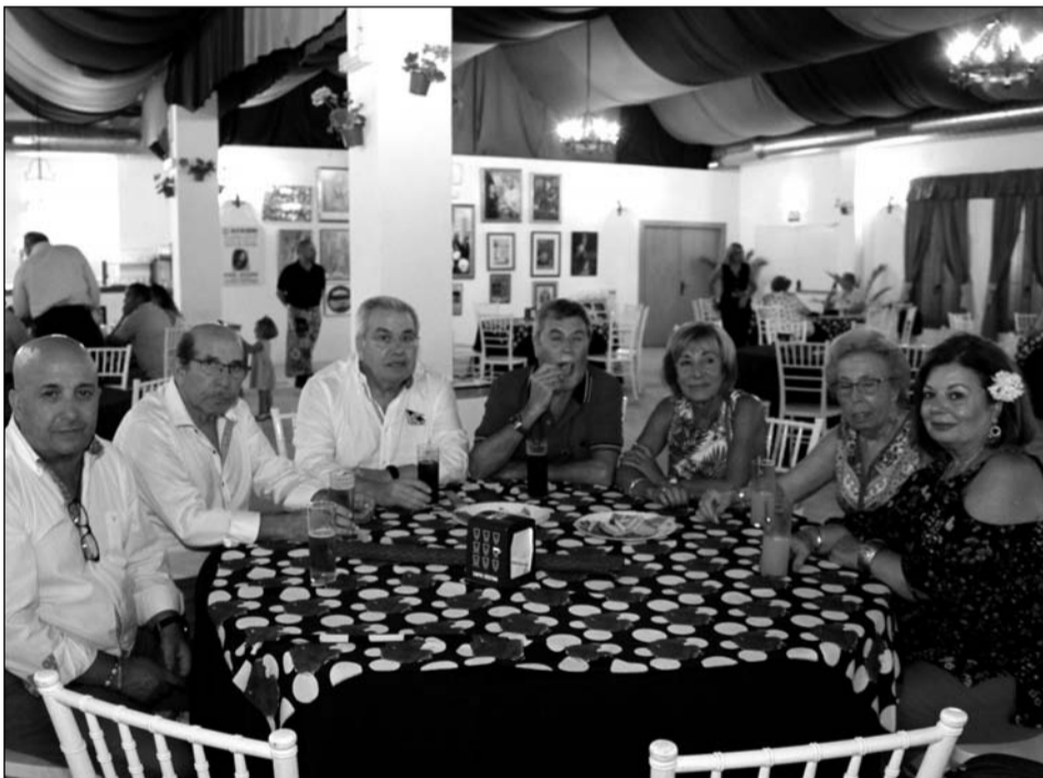
Visita de representantes de diferentes entidades federadas como El Portón y la Peña Trinitaria.