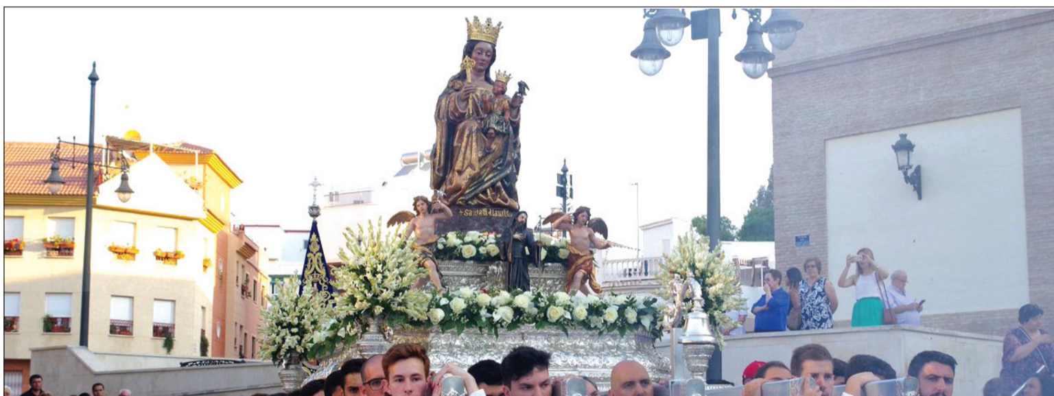
Traslado en Rosario de la Aurora de la Virgen de la Victoria a la Catedral el pasado 26 de agosto.

Además, el viernes 31 de agosto tenía lugar la Solemni-