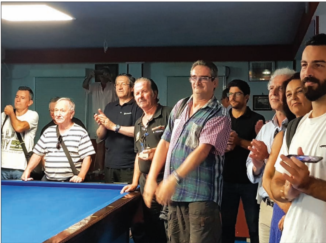
Acto de entrega de trofeos a la conclusión del torneo.