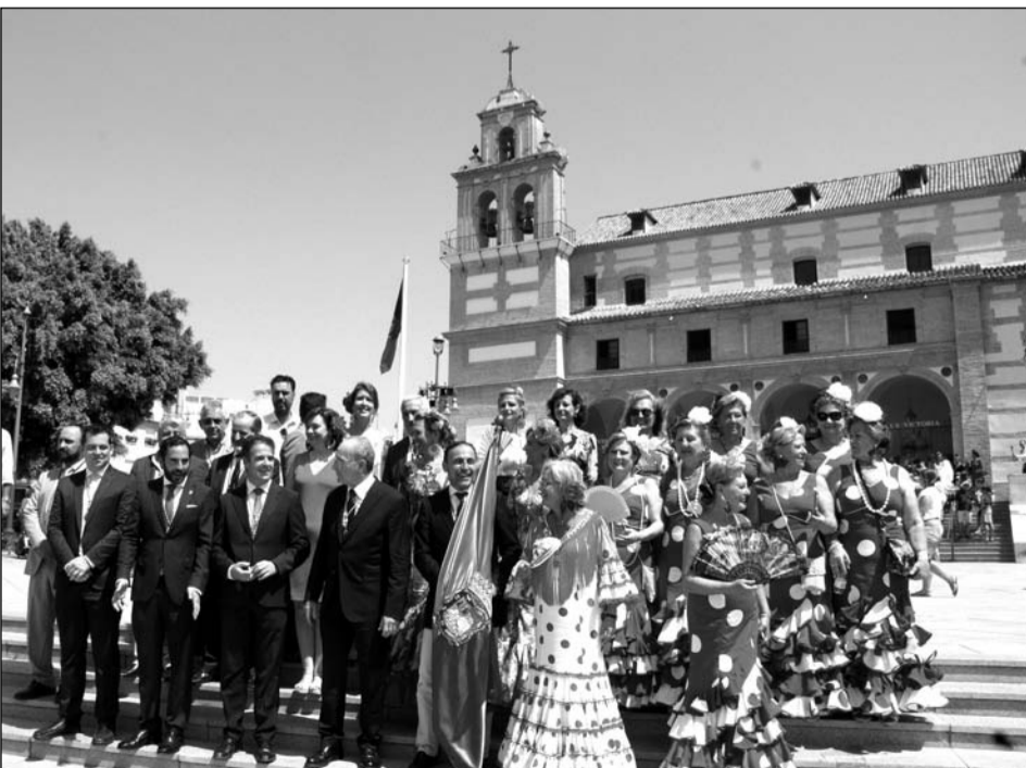
El abanderado, con autoridades y el coro de la Peña La Paz ante la Victoria.