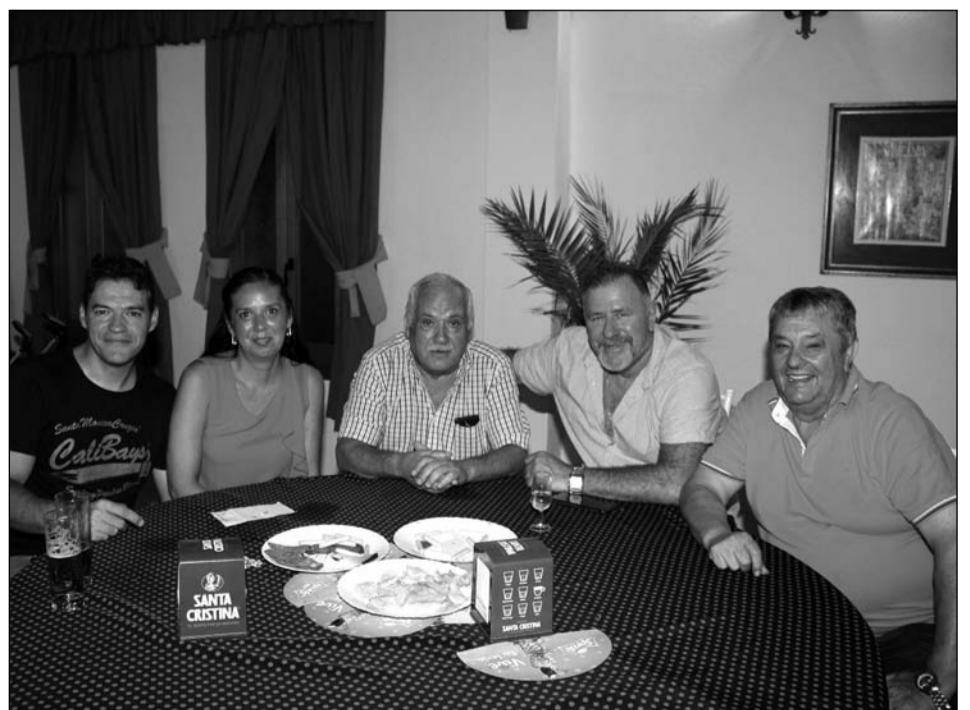
Componentes de la Peña Portada Alta visitan la caseta de la Federación Malagueña de Peñas.