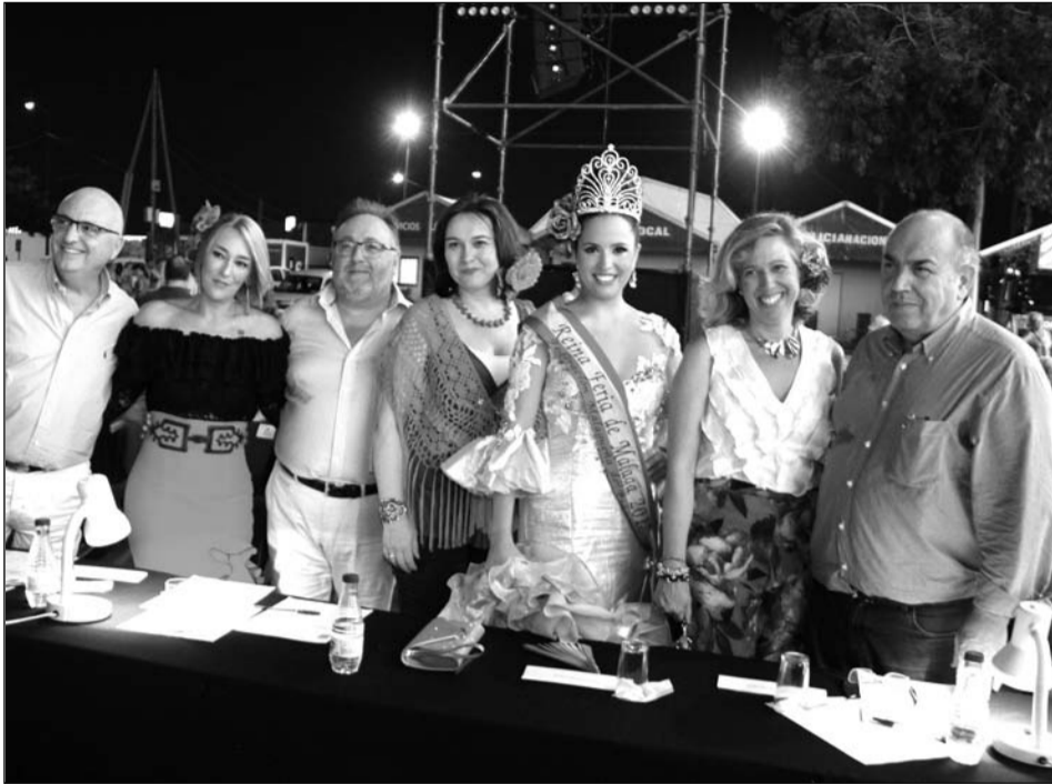
Componentes del jurado, presidido por el alcalde de Alhaurín de la Torre, Joaquín Villanova.