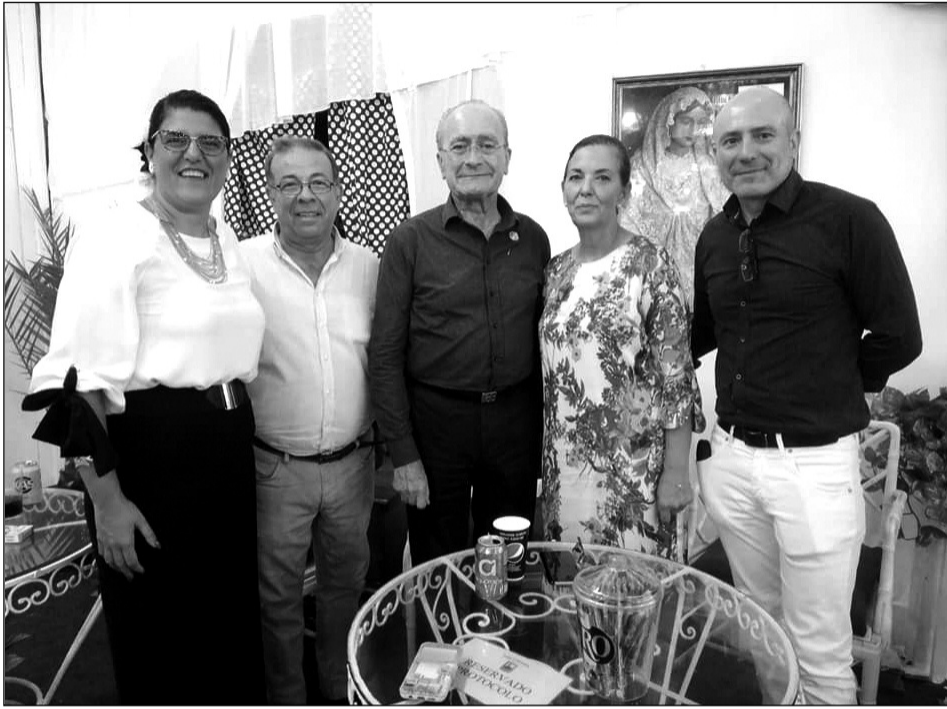
Visita del alcalde a la caseta de la Peña El Sombrero.