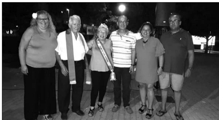
Elección de la Reina y el Mister en la cena del 10 de agosto.