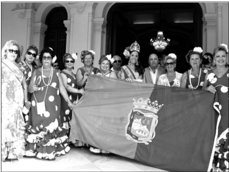
El Coro de la Peña La Paz participó un año más en la romería.

Una misa en el Santuario se daba por finalizado este acto y abría el programa de actos desarrollado durante todos estos días en la ciudad.