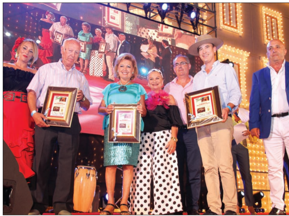
Galardones para las mejores fachadas de casetas peñistas.