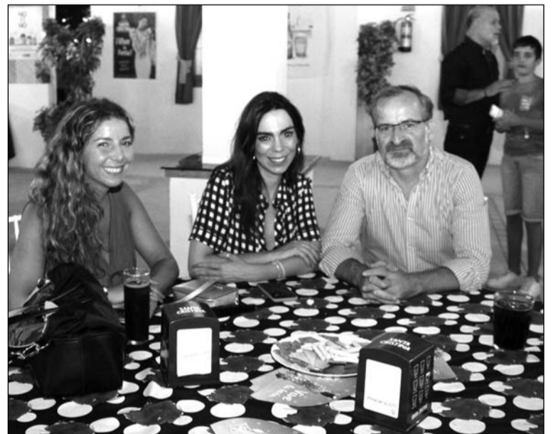
Representantes de Ciudadanos.