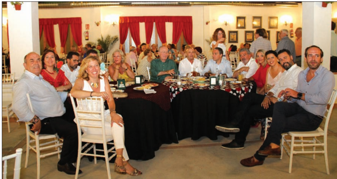
Representación municipal en la caseta de la Federación Malagueña de Peñas.

Entidades colaboradoras con esta publicación: