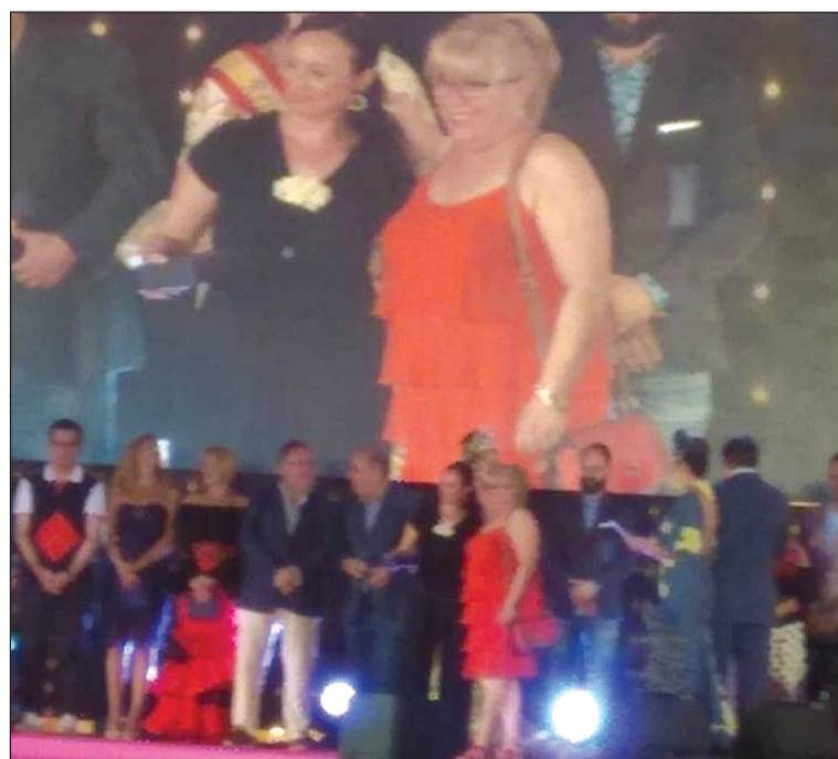
Entrega del premio.