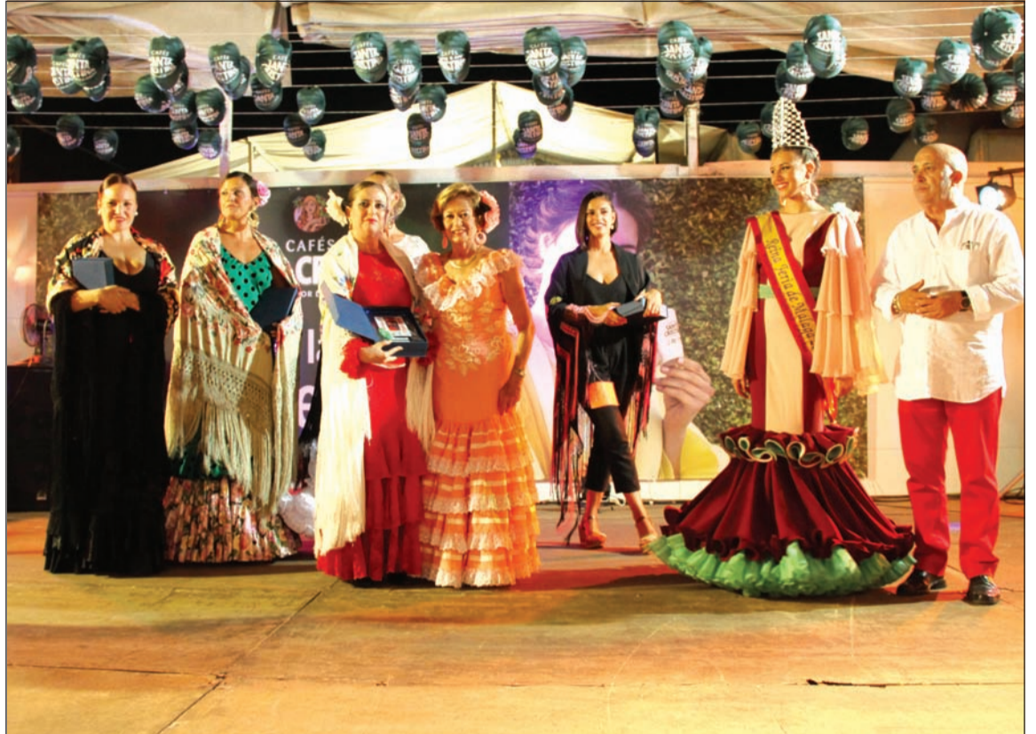
Ganadora del primer premio en la categoría de mantones pintados.