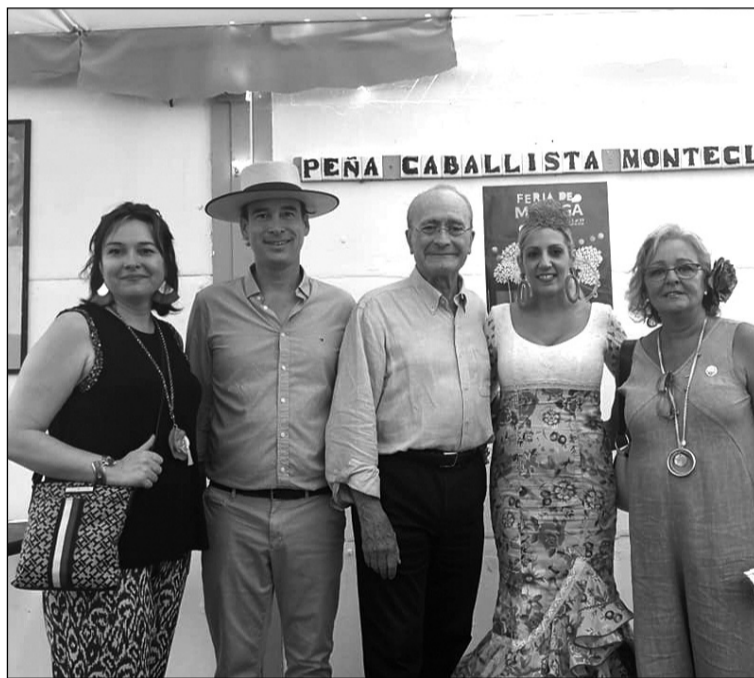
Autoridades visitan la caseta de la Peña.

Además de actuaciones en directo, el último día de feria, el domingo 19 de agosto, tenía lugar el Paseo de la Asociación Andaluza de Monta a la Amazona y Concentración de Enganches en esta caseta; congregando a un gran número de amantes del mundo del caballo.