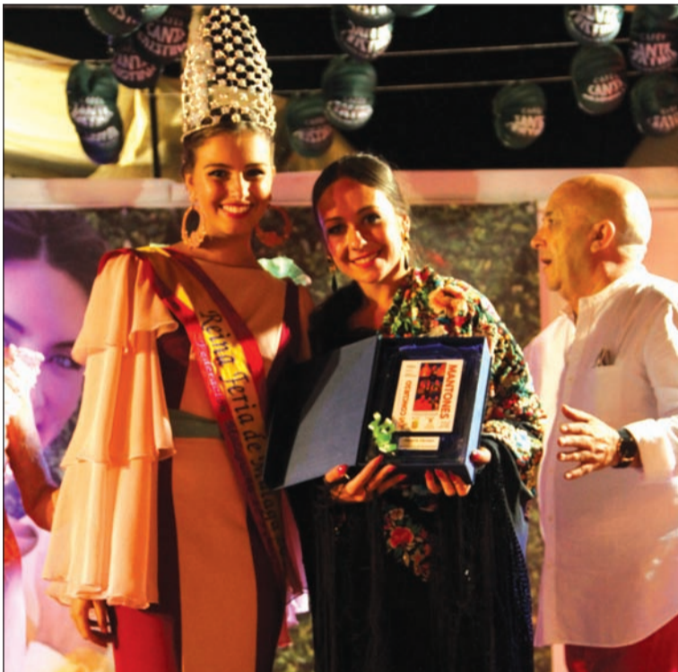
La Reina de la Feria entrega el premio a Mejor Lucimiento.

contaba con las categorías de mantones pintados y bordados, junto con la de mejor lucimiento. De este modo se lograba abrir el abanico a piezas antiguas y otras más nuevas; premiando el arte al vestir esta pieza por parte de la mujer malagueña.