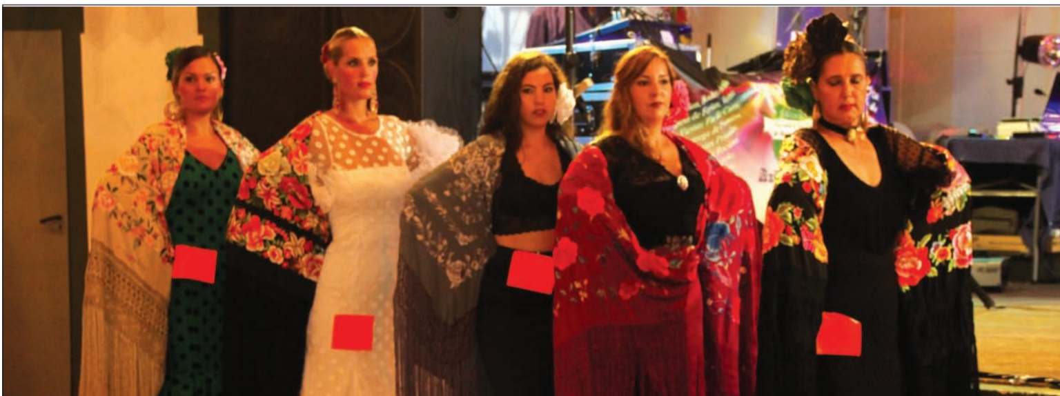
Participantes durante uno de los pases del XVI Concurso de Mantones de Manila.

Hay cosas que son exclusivamente malagueñas