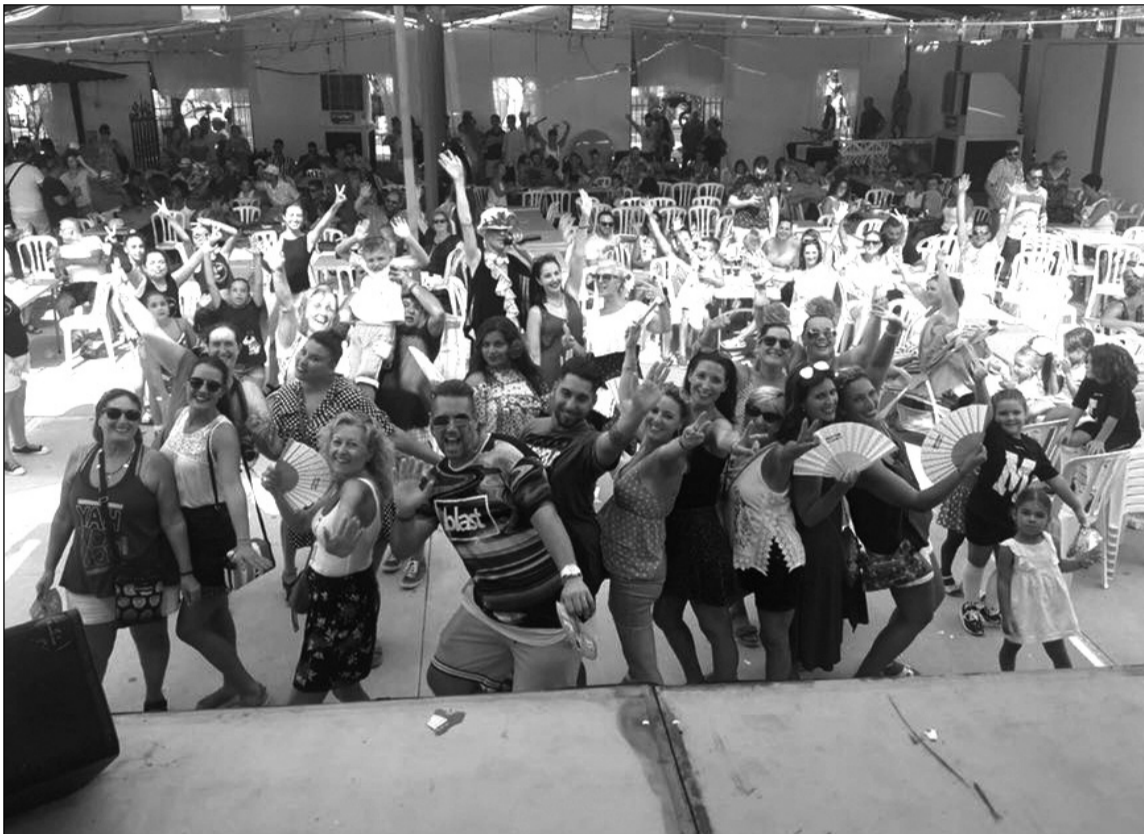
Peñistas disfrutaban de una de las mañanas de feria.