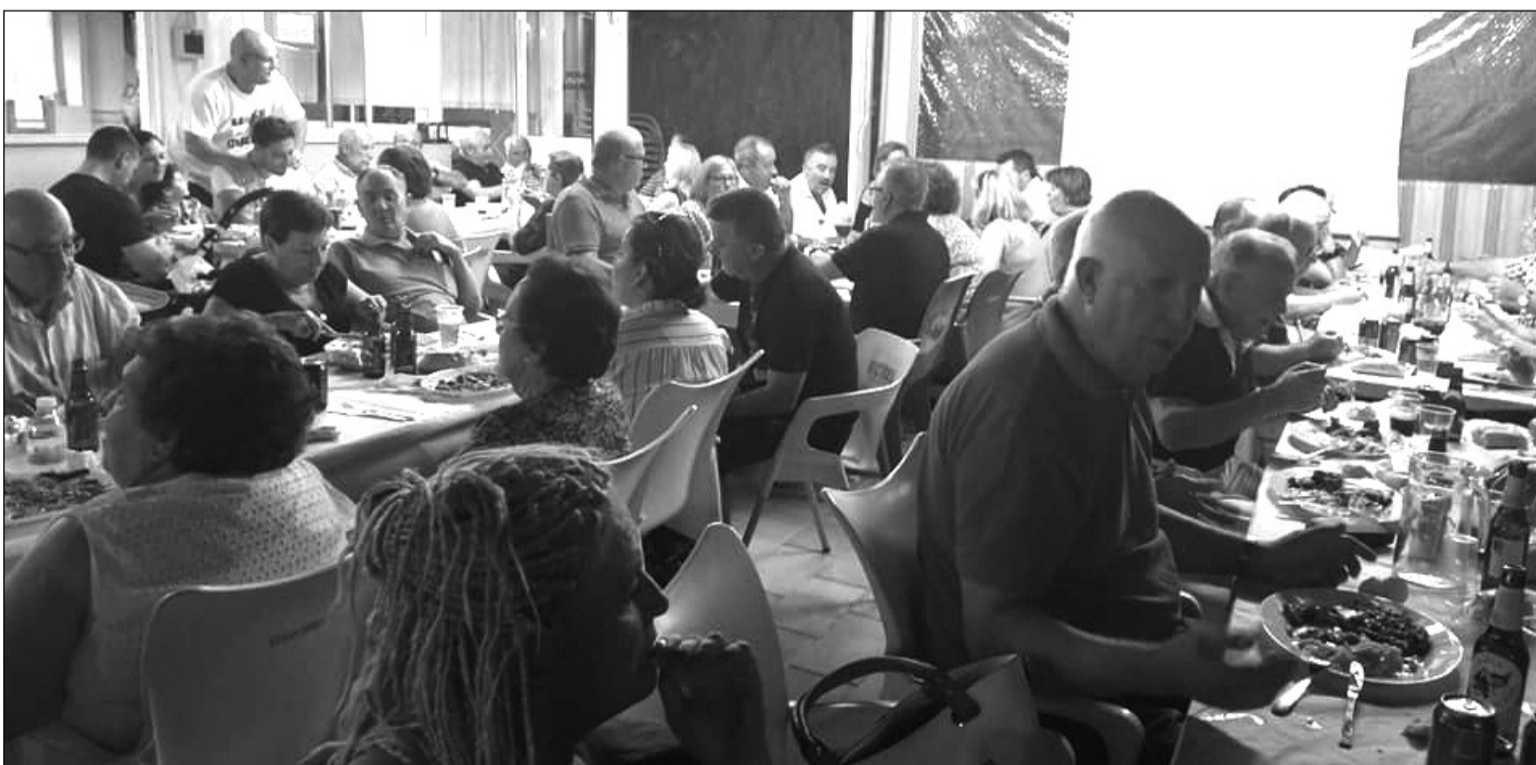
Ambiente en la terraza de la Peña Colonia Santa Inés en la noche del viernes 10 de agosto.