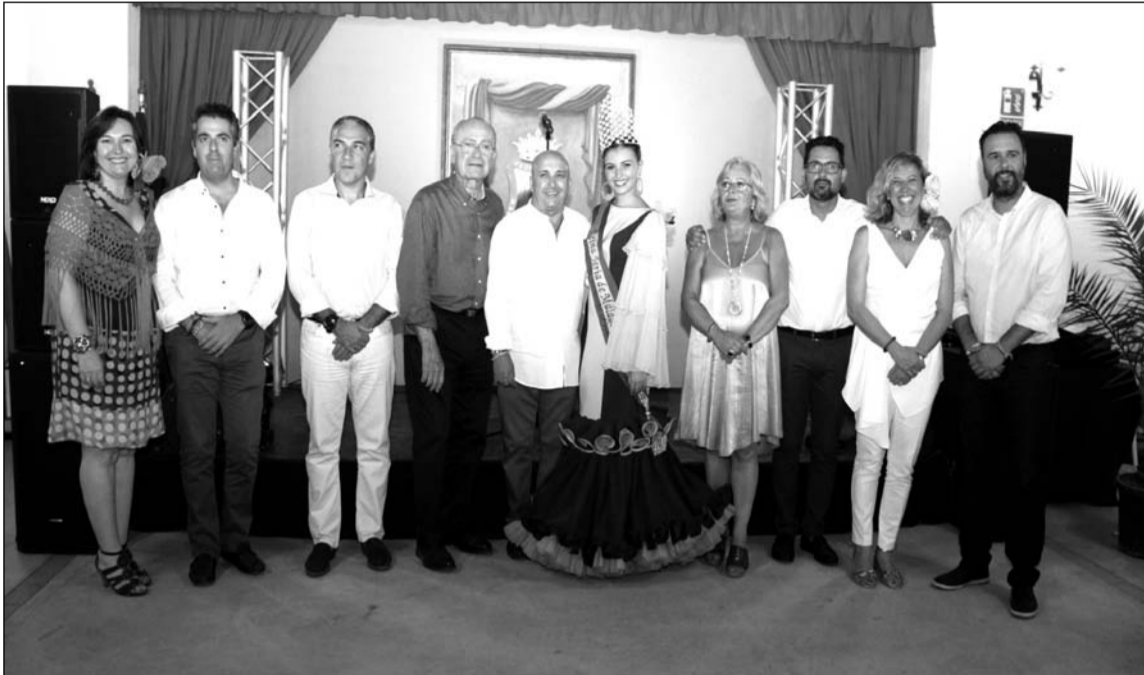
El alcalde y el presidente de la Diputación, con concejales, el presidente de la Federación y la Reina de la Feria.