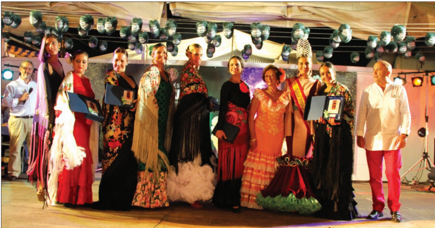
Entrega de premios del XVI Concurso de Mantones de Manila, celebrado el viernes 17 de agosto en la Caseta de la Casa de Álora Gibralfaro y Cafés Santa Cristina.