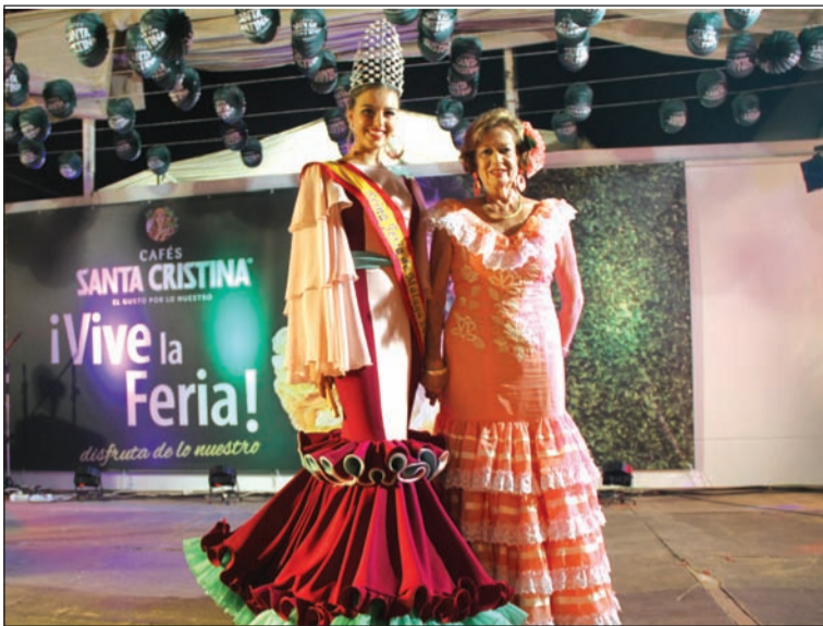
La presidenta de la Casa de Álora con la Reina de la Feria.