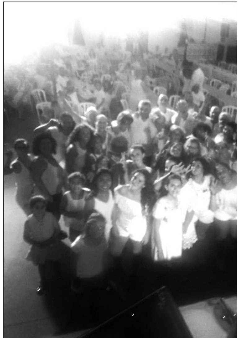
Los socios se vistieron de blanco para la Noche Ibicenca.