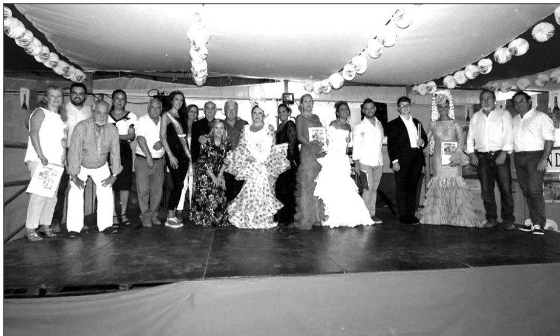
Entrega de premios del certamen.