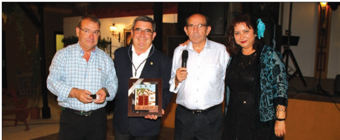
Entrega del reconocimiento en la jornada del sábado 11 de agosto en la caseta de El Portón.

Además, como es tradicional, una fotografía suya y una placa conmemorativa fue colocada en un lugar destacado de esta caseta.