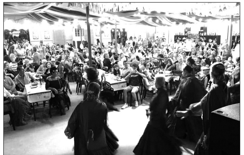
Ambiente en la caseta durante el IX Encuentro de Malagueñas.