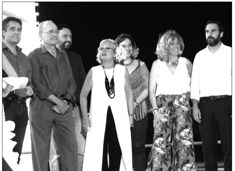
Autoridades asistentes al acto que participaron en la entrega de premios.