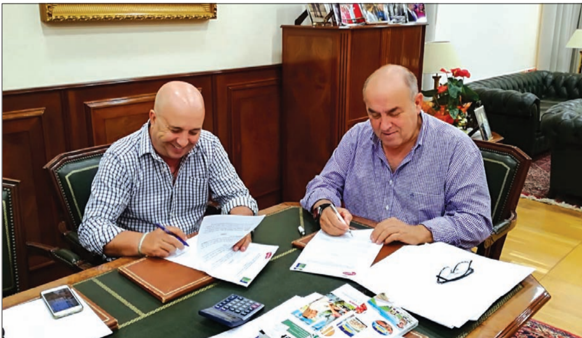
Firma del convenio entre la Federación Malagueña de Peñas y Famadesa.

Famadesa, que da empleo a un millar de personas, está especializada en la producción de carne de cerdo de capa blanca, jamones, embutidos y otros productos elaborados, que exporta sobre todo a Europa (Portugal, Italia, Francia, Alemania, Grecia, Rumania, República Checa y Eslovenia, entre otros) y a Asia a países como China, Corea, Vietnam, Taiwan, Hong Kong y Filipinas. Exporta casi el 40 por ciento de su producción a países de los cinco continentes, siendo el asiático uno de sus principales mercados. En Europa, sus principales destinos son el mercado interior y Portugal.