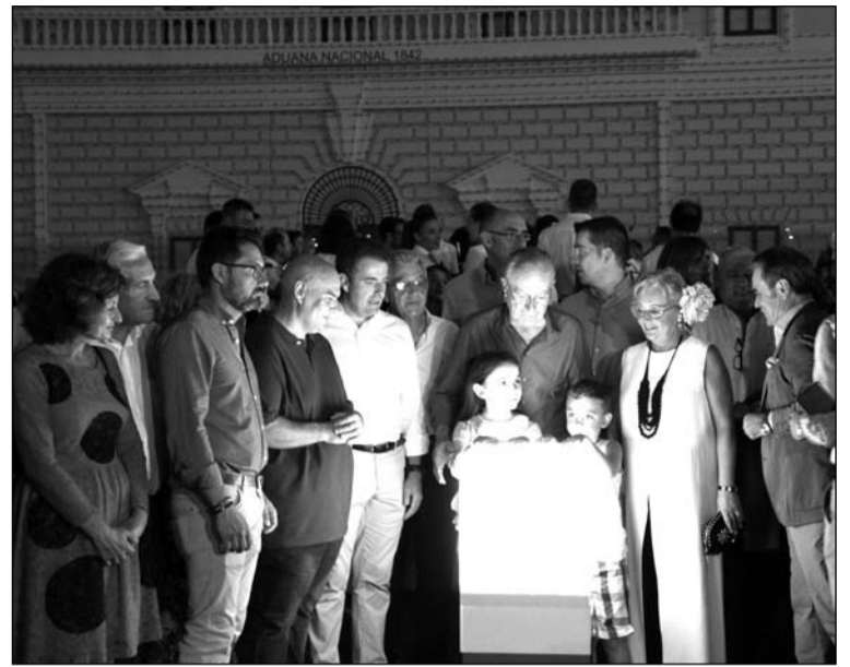
Instante en el que se pulsa el botón de encendido.