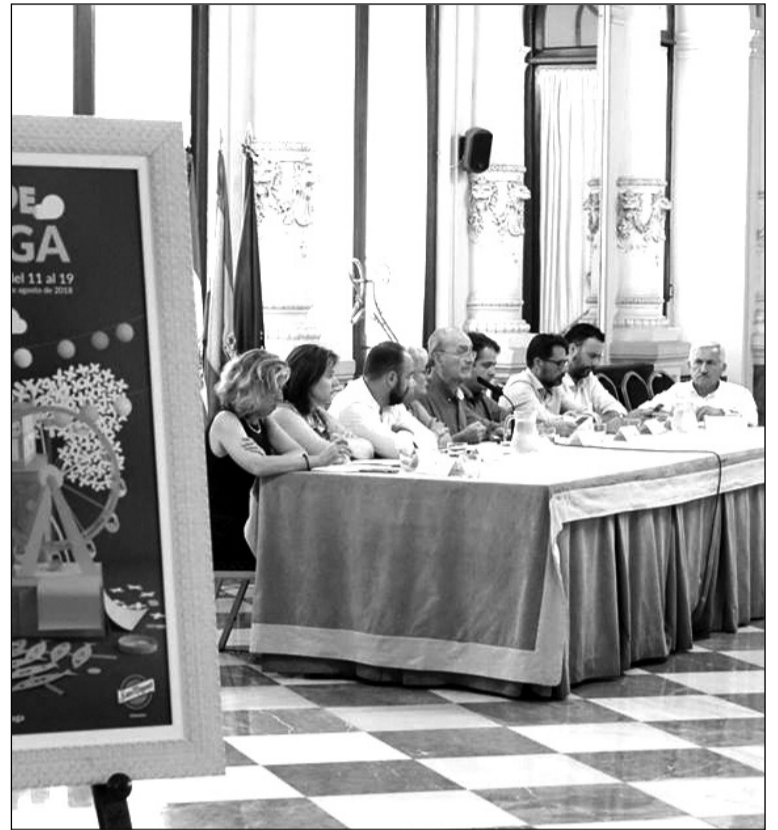
Rueda de prensa en el Salón de los Espejos.

Más de un millón de personas han asistido este año a los espectáculos programados por el Ayuntamiento de Málaga, lo que supone un incremento del 5,3 por ciento respecto a la pasada