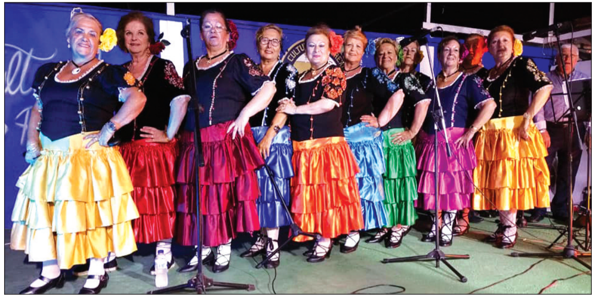
Trajes de Malagueña en la caseta del Centro Cultural Renfe.

Cada año, el Área de Fiestas del Ayuntamiento de Málaga edita un CD con los temas clasificados para la final, que ha sido distribuido desde la Federación Malagueña de Peñas gratuitamente entre todas las casetas para que pudieran disponer de las nuevas composiciones de este género.