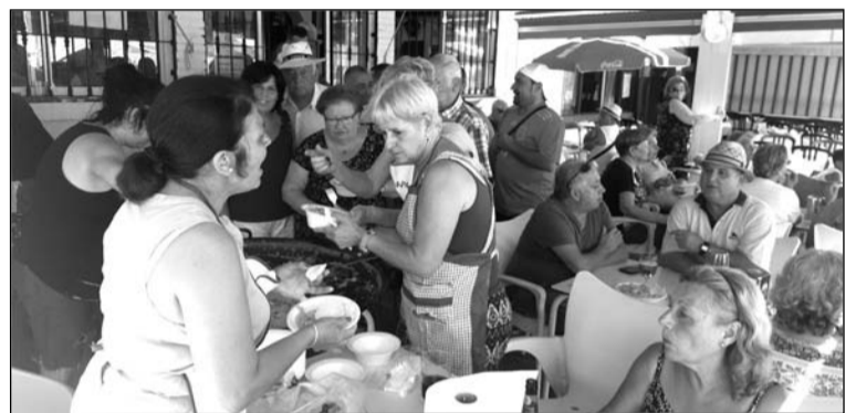
Socios en la terraza de la peña.

La Feria no ha pasado desapercibida para esta peña, que el pasado viernes 17 de agosto convocaba a sus socios para disfrutar juntos con la actuación del cantaor El Carretero.