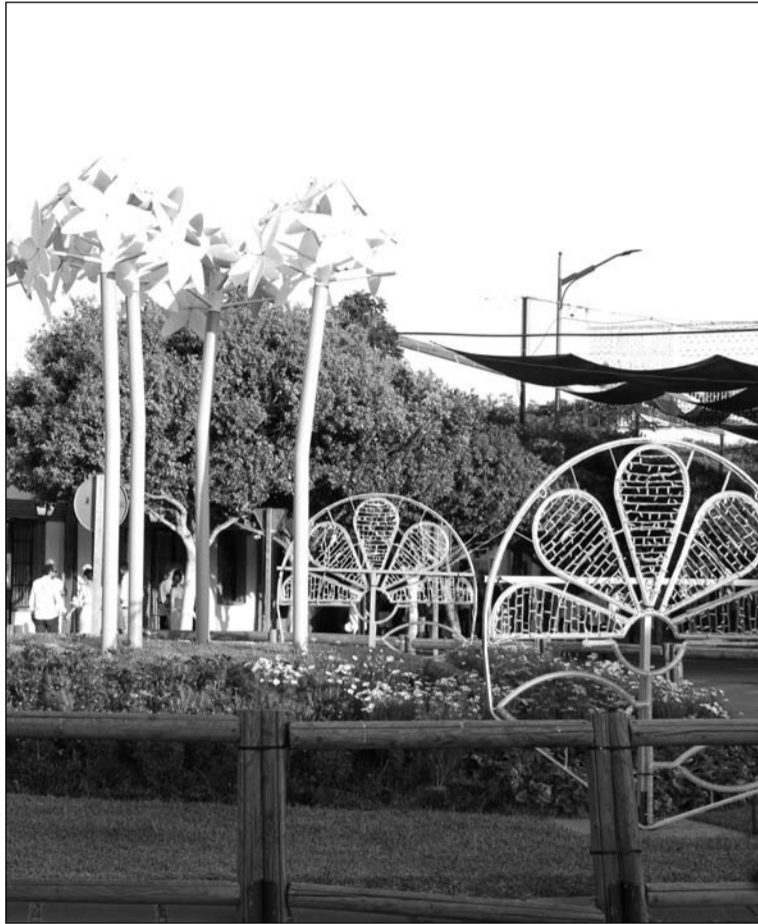
Elementos lumínicos en Cortijo de Torres.