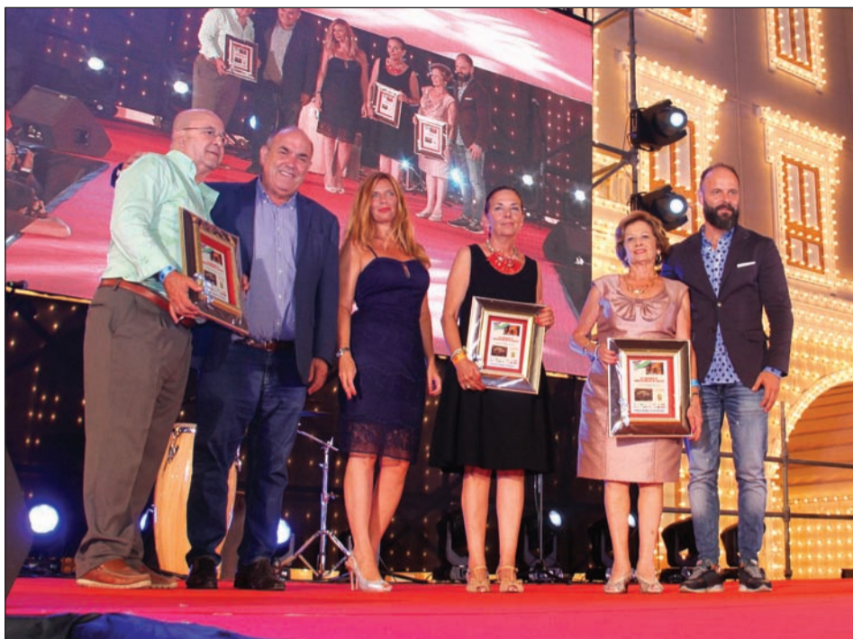
Entrega de premios en la categoría de interiores.