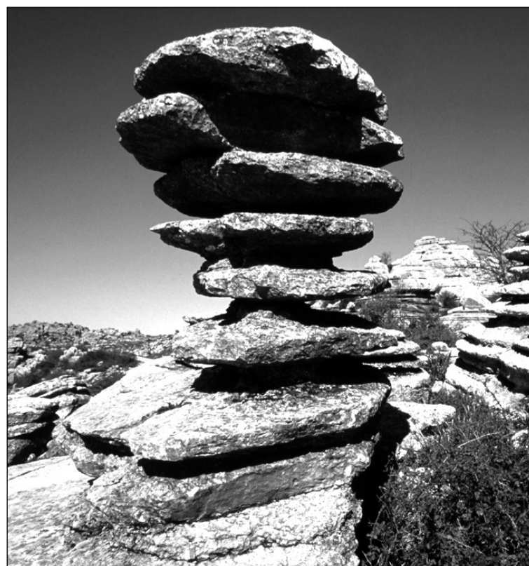
El Tornillo, una de las formas más reconocibles de El Torcal de Antequera.

Las entidades que quieran participar en este programa deberán estar al corriente de sus cuotas con esta Federación.