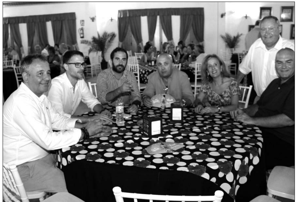
Miembros del grupo municipal socialista.