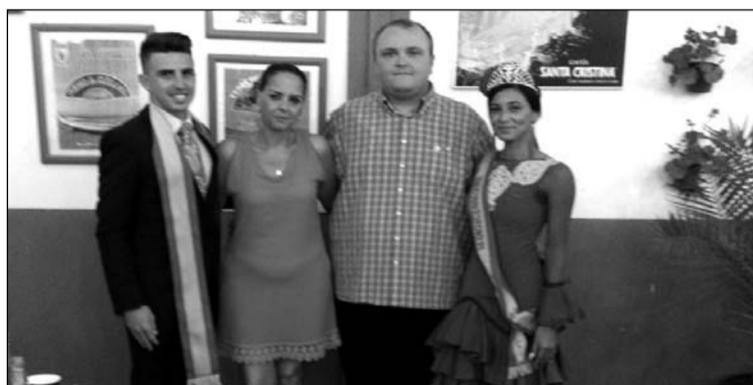
Visita a la caseta de la Peña Recreativa Trinitaria.

Además, el Coro Brisas Malagueñas ha participado con diferentes actuaciones, difundiendo el folclore tradicional en estas fiestas.