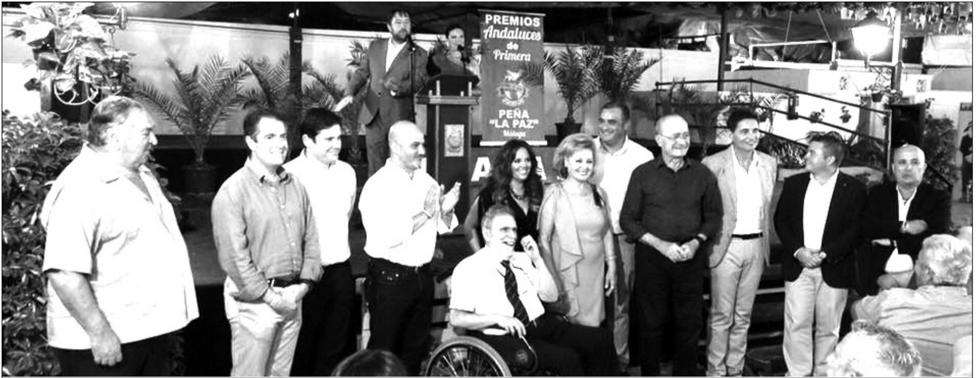
Imagen del acto de entrega de Premios Andaluces de Primera 2018.