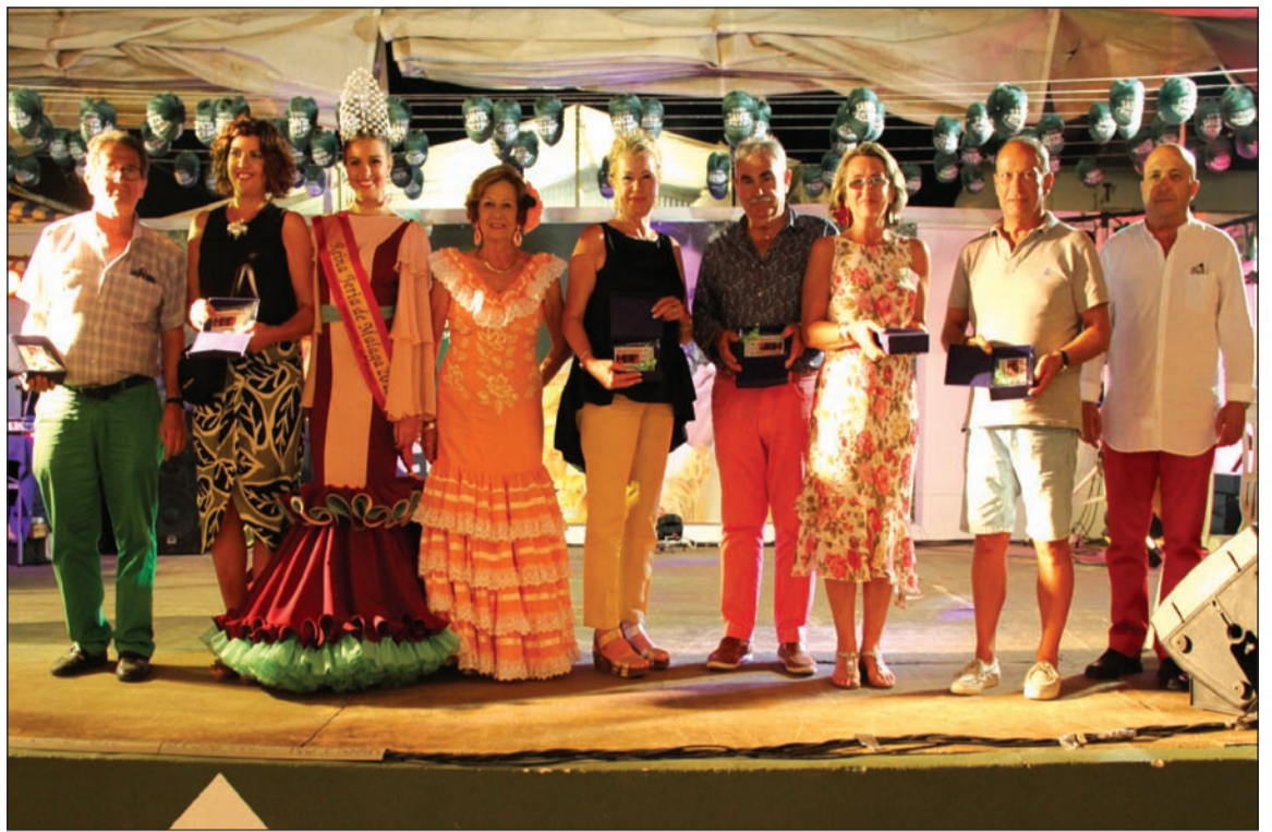
Recuerdos a los miembros del jurado.