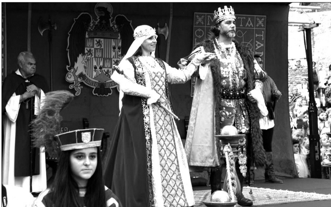
Recreación de la toma de la Ciudad.

El origen de la cabalgata data de 1887 cuando un grupo de malagueños deciden conmemorar el cuarto centenario de la toma de la ciudad por los Reyes Católicos.