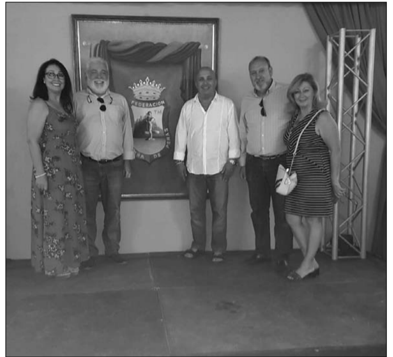
Visita de la Federación de Peñas Cordobesas.

Artistas y otras personalidades de diferente índole se han encontrado entre los distintos rostros conocidos que se han dejado ver por la Caseta La Alcazaba desde el 11 al 19 de agosto.