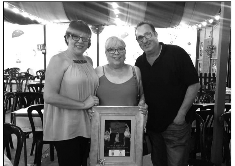
La entidad volvió a ganar el Premio Por Malagueñas.