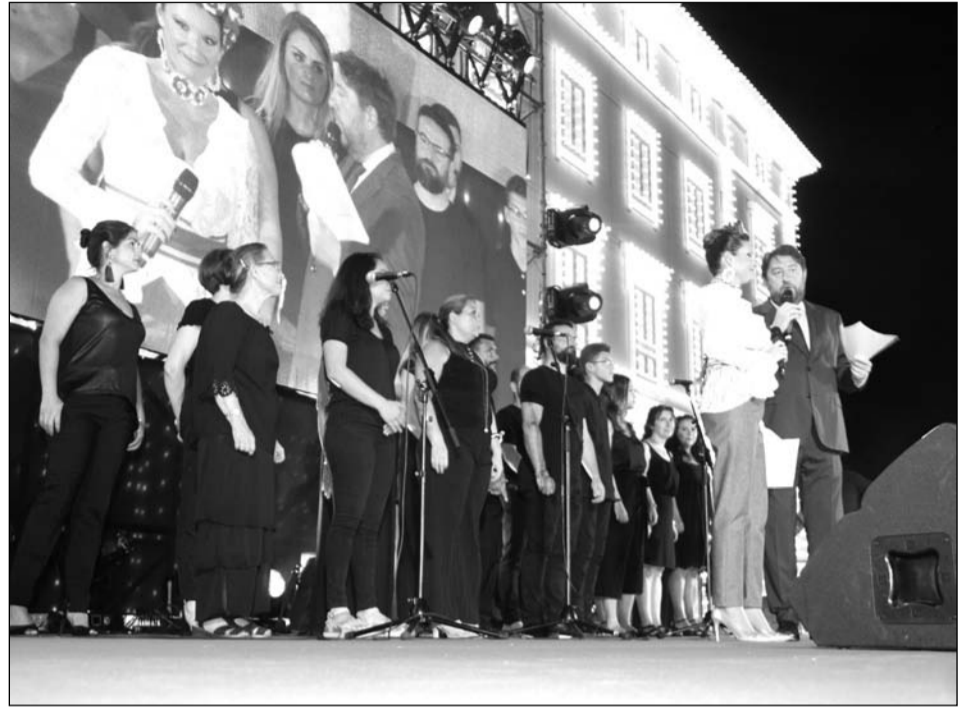
En la gala, presentada por Rocío Alba y Pepelu Ramos, se contó con un coro gospel.