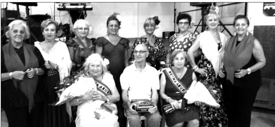
Actividad dedicada a los mayores.