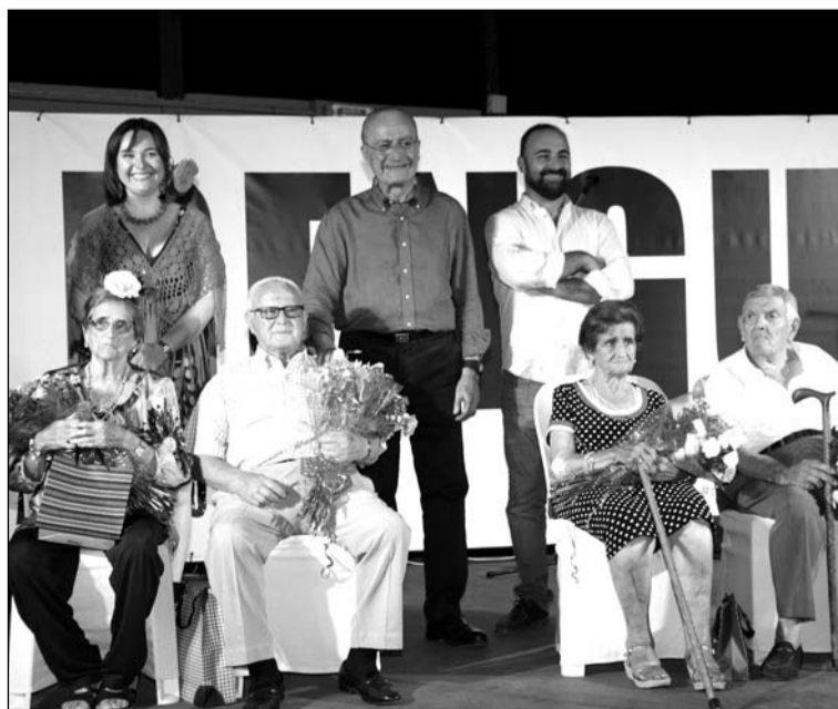
Reconocimiento a los mayores en uno de los días de Feria.

El Rengue ha vuelto a ser el lugar de los mayores en la Feria de Málaga. Desde el Área de Derechos Sociales, junto a los once distritos municipales, se ha ofrecido cada noche una cena amenizada por la actuación de coros rocieros de mayores. Además, cada día se ha elegido al rey y reina de la noche y se ha contado gratuitamente con baile con orquesta.