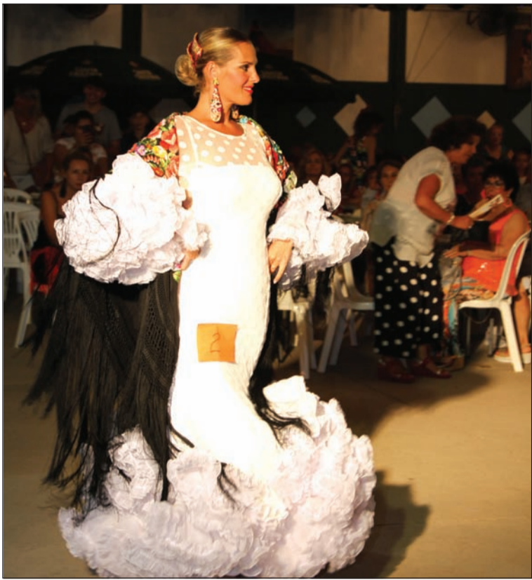
Pase del mejor mantón bordado.