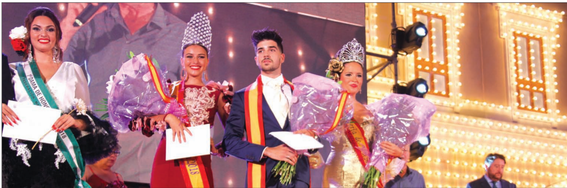
El Mister, en el centro de la imagen, acompañado por las Reinas de 2018 y 2017.