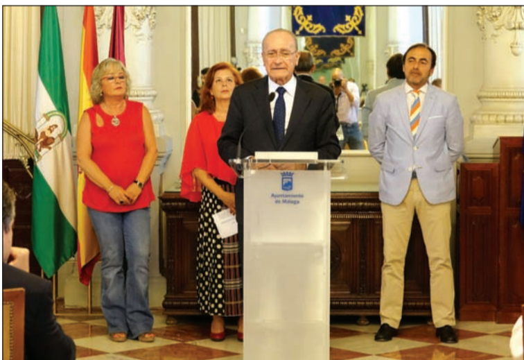
Intervención del alcalde.