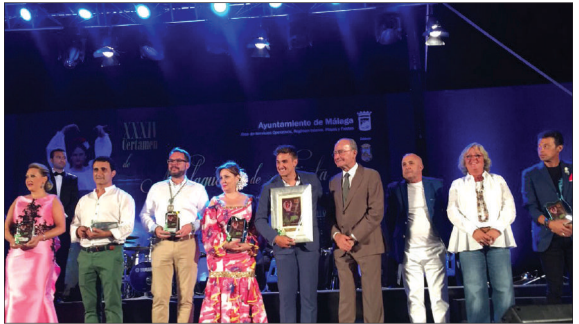
Acto de entrega de premios.

Aún no entrando en concurso, se ha configurado el baile como parte esencial del Certamen, por lo que atañe a la difusión que se persigue su acompañamiento; contándose con dos grupos por tema finalista.