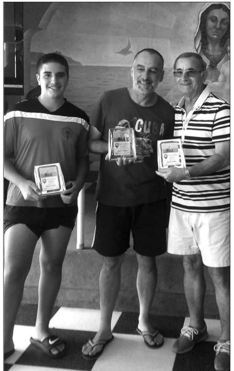
Reconocimientos a los participantes.