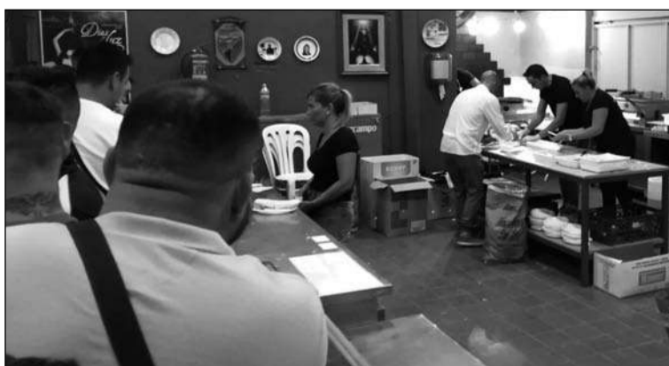
La Peña Los Corazones colaboró con la barra de la fiesta.

De este modo, la gran familia que conforma este pujante club deportivo de la barriada celebraba el fin de una temporada exitosa en lo deportivo.