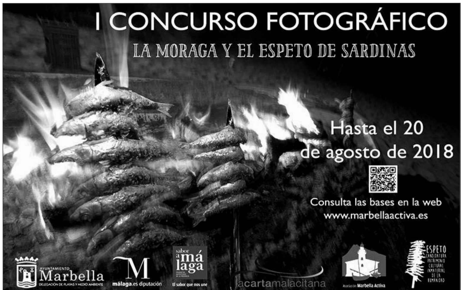
Cartel del certamen fotográfico.