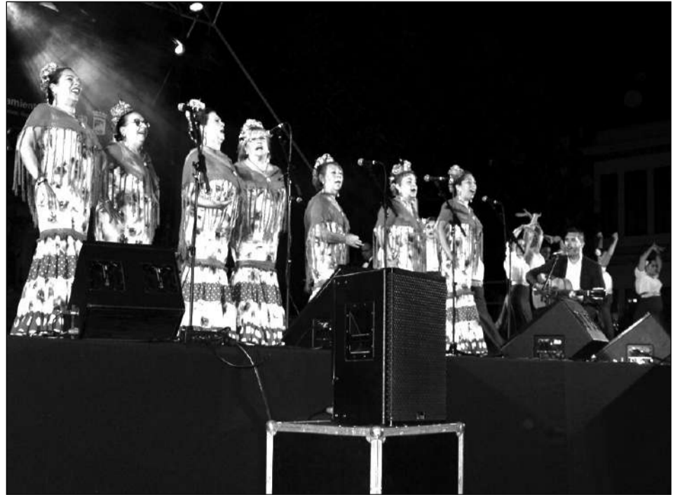
Coro Hermandad de la Alegría.