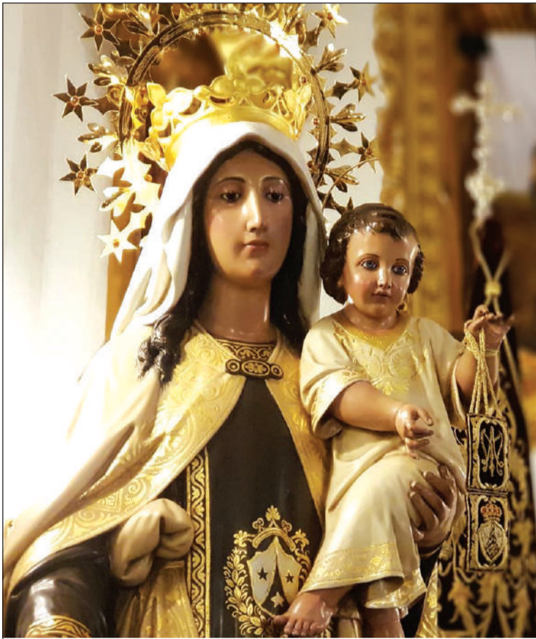
Virgen del Carmen del Palo.