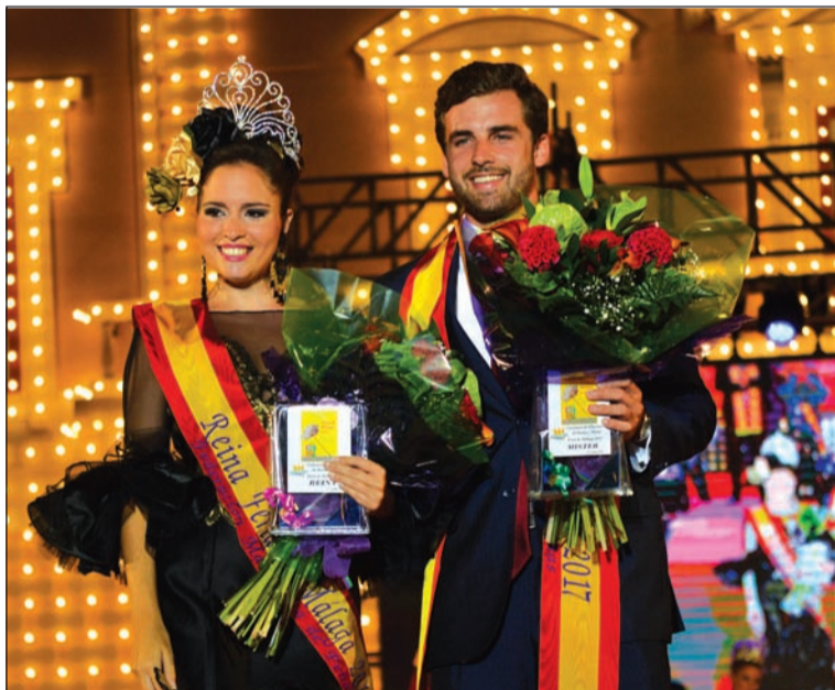
Reina y Mister del pasado año.

A falta de terminar de concretar el programa de actividades que va a desarrollar la Federación Malagueña de Peñas, Centros Culturales y Casas Regionales 'La Alcazaba' durante la próxima Feria de Málaga 2018, desde la Junta Rectora de se apuesta por mantener los eventos tradicionales.