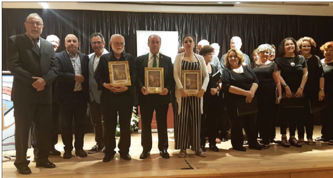
Entrega de un recuerdo en agradecimiento a la colaboración de los participantes del acto.

Este Pregón Marinero alcanzará el próximo año su cuarenta edición, aunque sus orígenes son anteriores, ya que durante unos años dejó de celebrarse y fue recuperado recientemente en el primer año en el cargo del actual presidente de esta entidad federada.