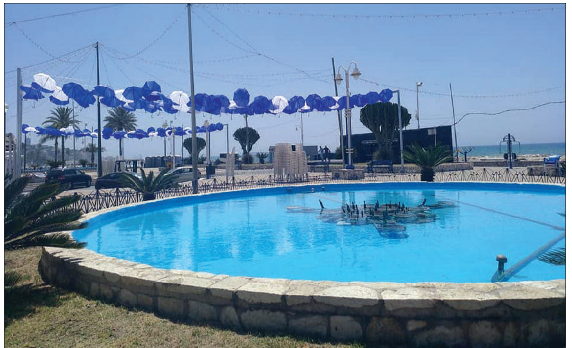
Recinto ferial en el Paseo Marítimo.

rana y de petanca, un partido de veteranos organizado por el Club Baloncesto El Palo y los tradicionales concursos de sotorraje, campeonato de subastao y la Regata de Barcas de Jábega.