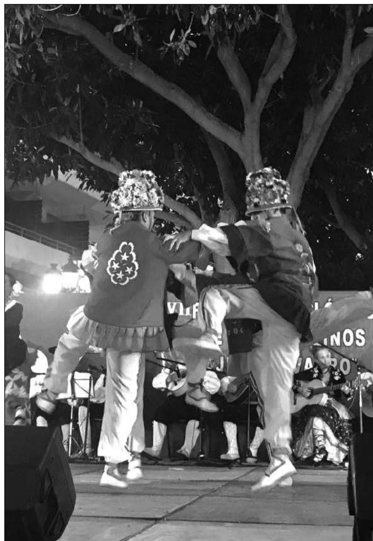
Exhibición de la agrupación conquense, sobre el escenario