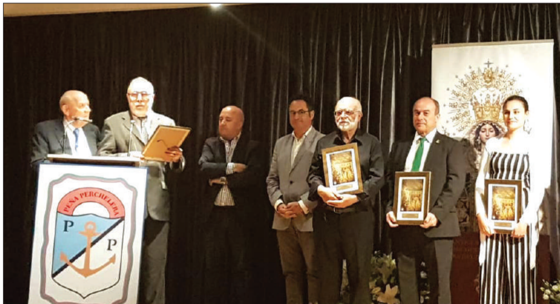
Intervención del presidente durante la entrega de recuerdos.

Entidades colaboradoras con esta publicación: