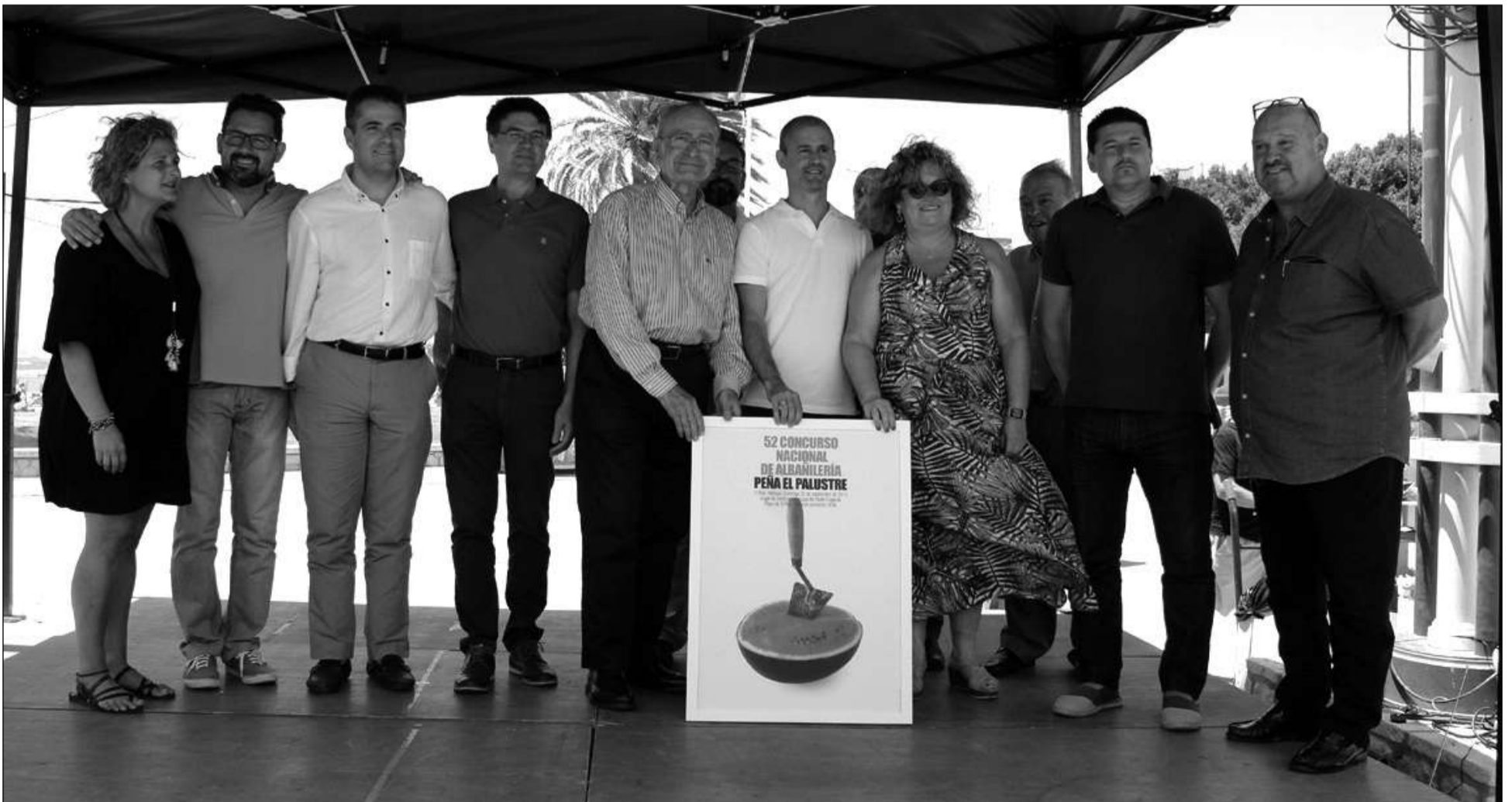
Autoridades asistentes y componentes de la entidad, con el autor del cartel y su obra tras ser presentada.

mientos técnicos ejecutando simultáneamente el mismo trabajo de albañilería ante un jurado integrado por arquitectos, aparejadores, arquitectos técnicos, constructores y el oficial ganador de la última edición.