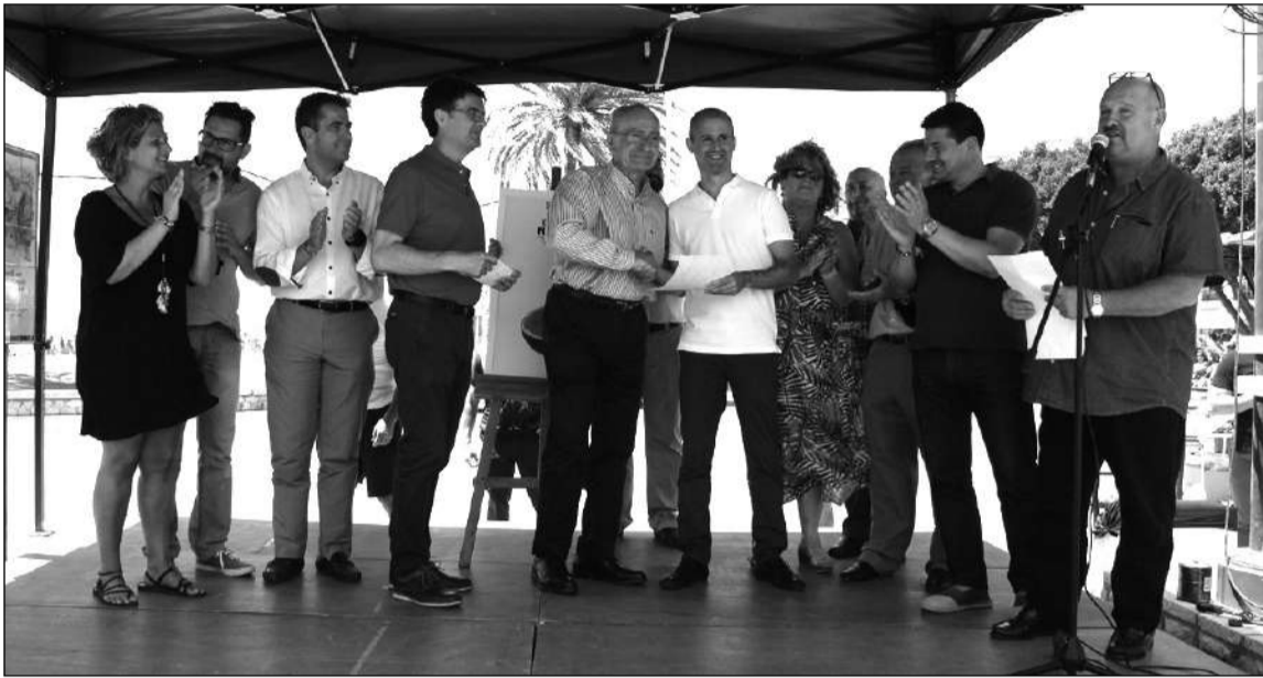
El alcalde entrega un reconocimiento al autor del cartel.