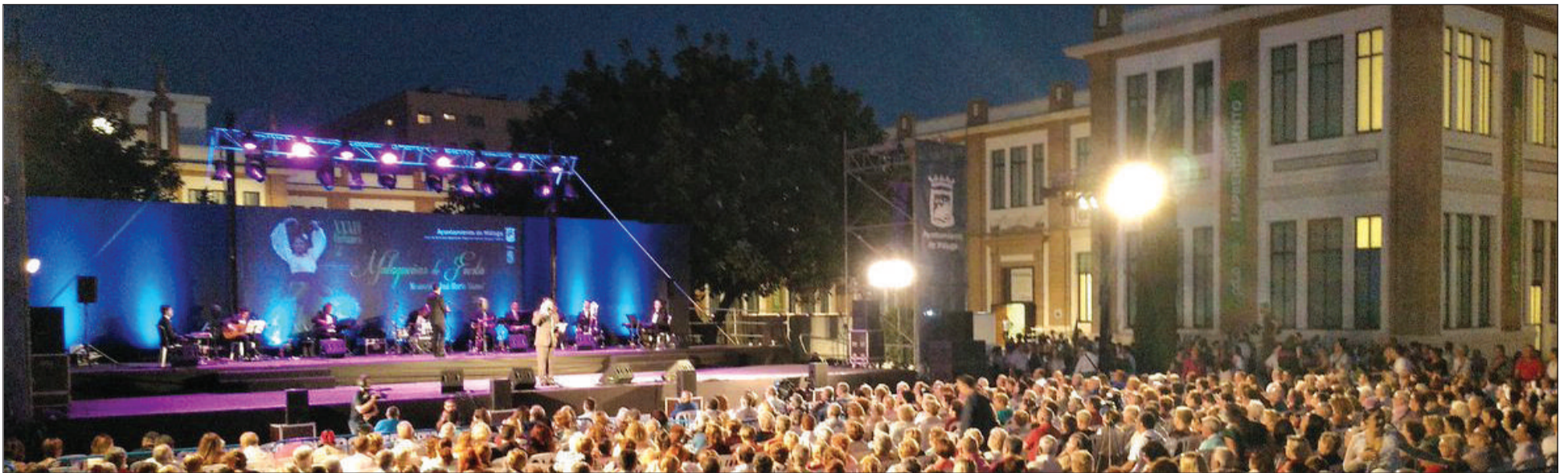
Aspecto que presentaba el Auditorio de Tabacalera al comienzo de la final.