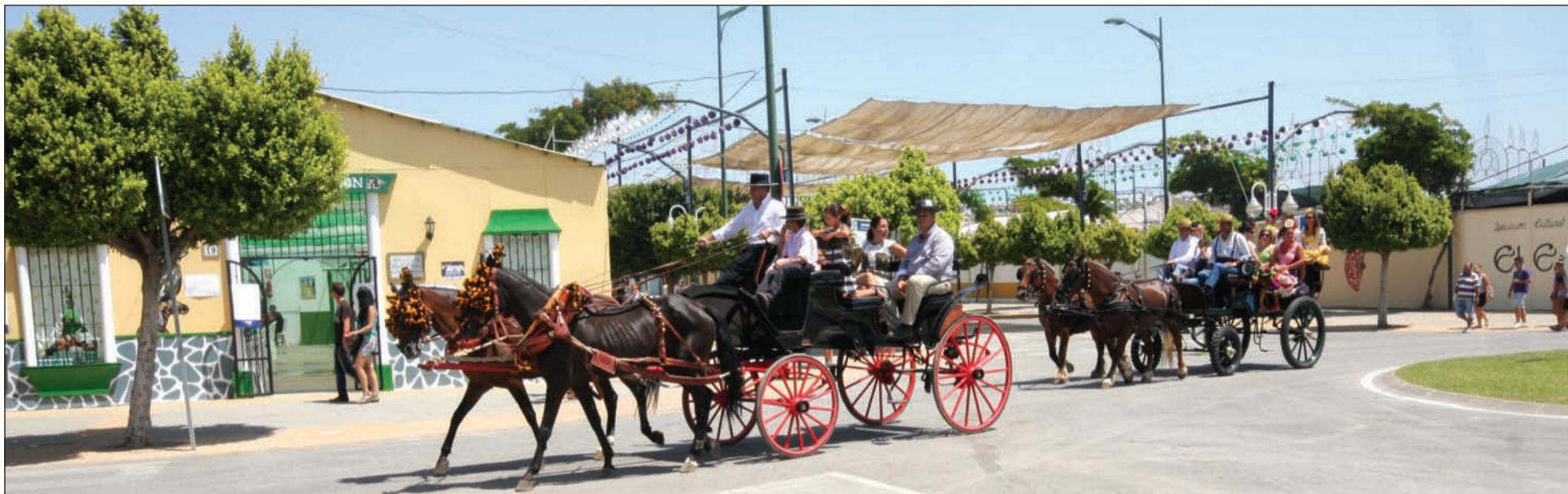
Vista general del recinto ferial de Cortijo de Torres.