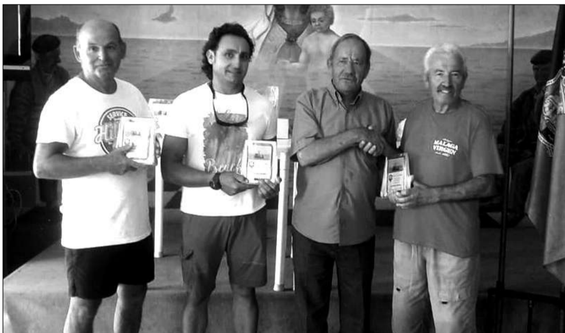
Entrega de trofeos.

tras lo que los participantes se desplazaron hasta la sede de esta entidad perteneciente a la Federación Malagueña de Peñas, Centros Culturales y Casas Regionales 'La Alcazaba', en la Cala del Moral, donde se realizaba la entrega de premios y se ofrecía una copita a todos los participantes.