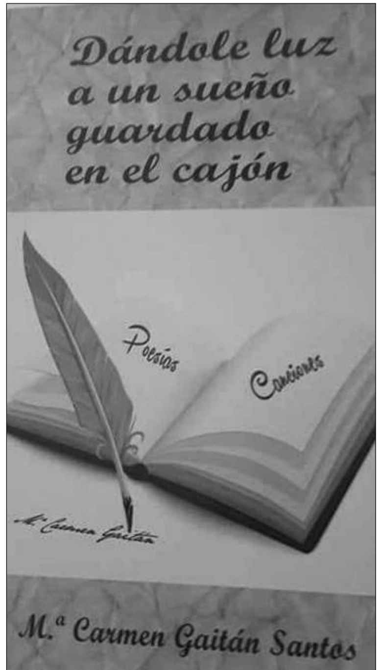
Portada del libro.

La autora procedía a la conclusión del acto a la firma de ejemplares para todas las personas que desearon adquirirlo.