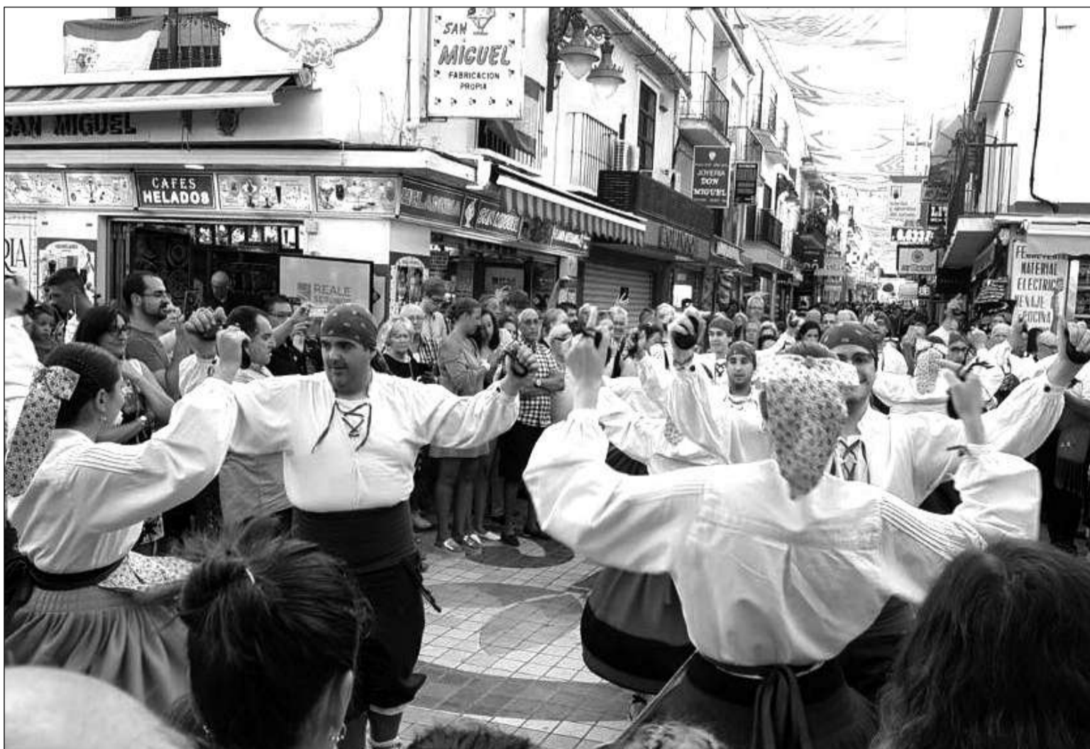
Las calles abarrotadas para presenciar la muestra del grupo procedente de la comunidad de Madrid