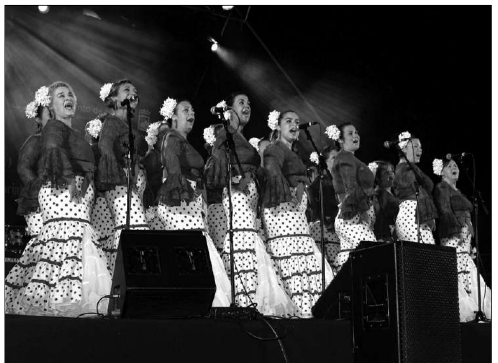
Coro La Alegría del Puerto.