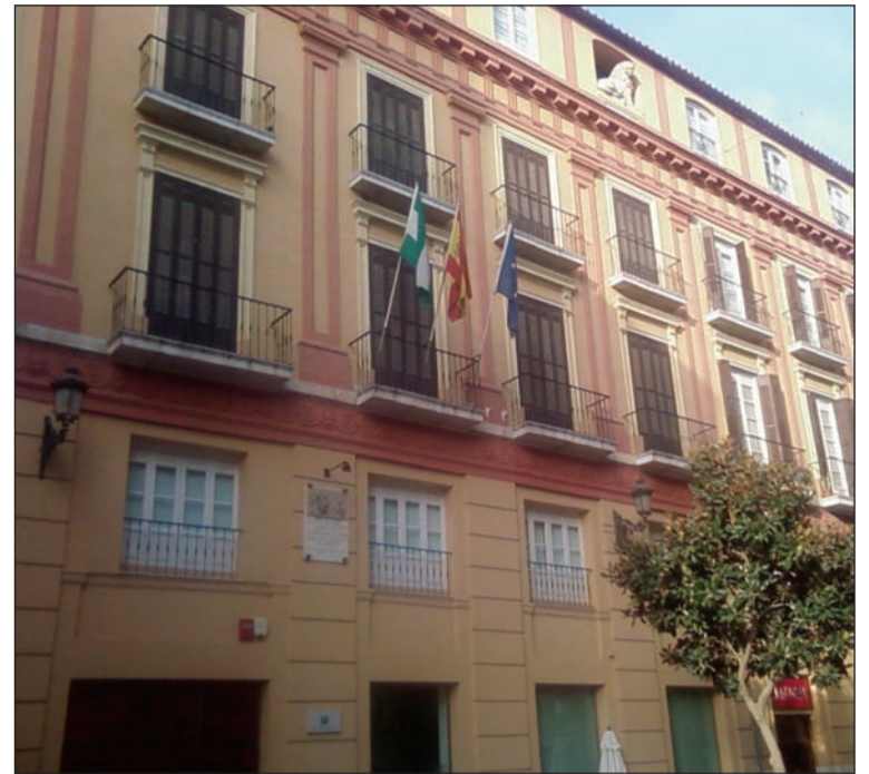
Sede de Turismo Andaluz en Málaga, en el antiguo Parador de San Rafael.