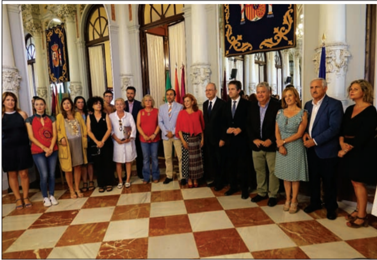
Asistentes al acto con el abanderado.