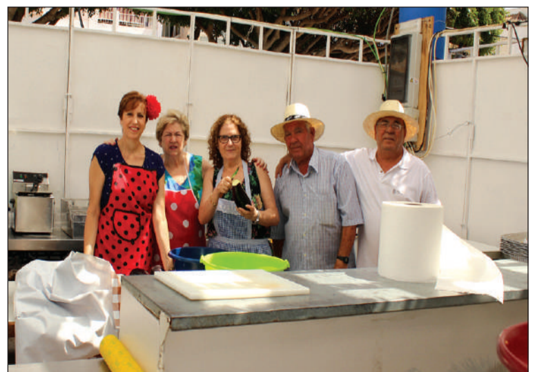
Cocina de la Peña El Palustre.