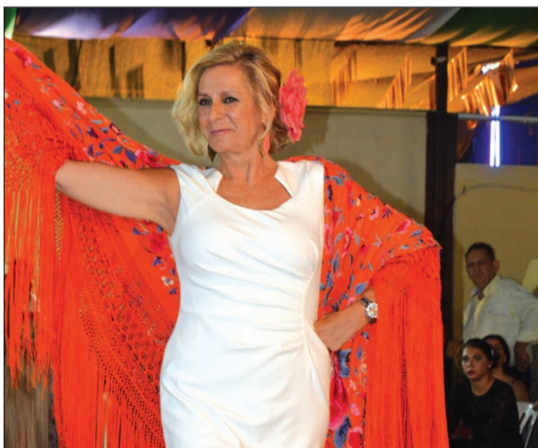
El Concurso de Mantones de Manila se celebrará el viernes 17 de agosto.