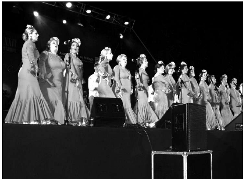
Coro Hermandad del Rocío de Torremolinos.