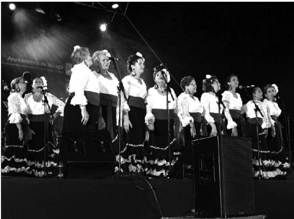
Grupo Folclórico Solera.