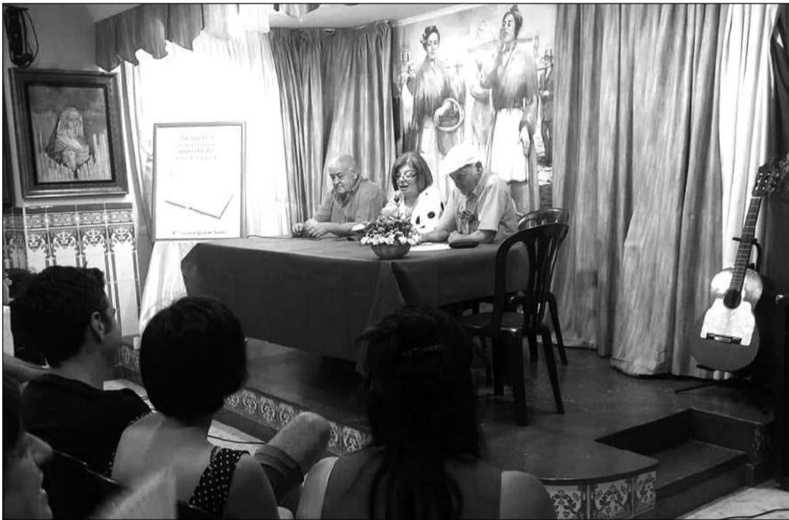
Un instante de la presentación.