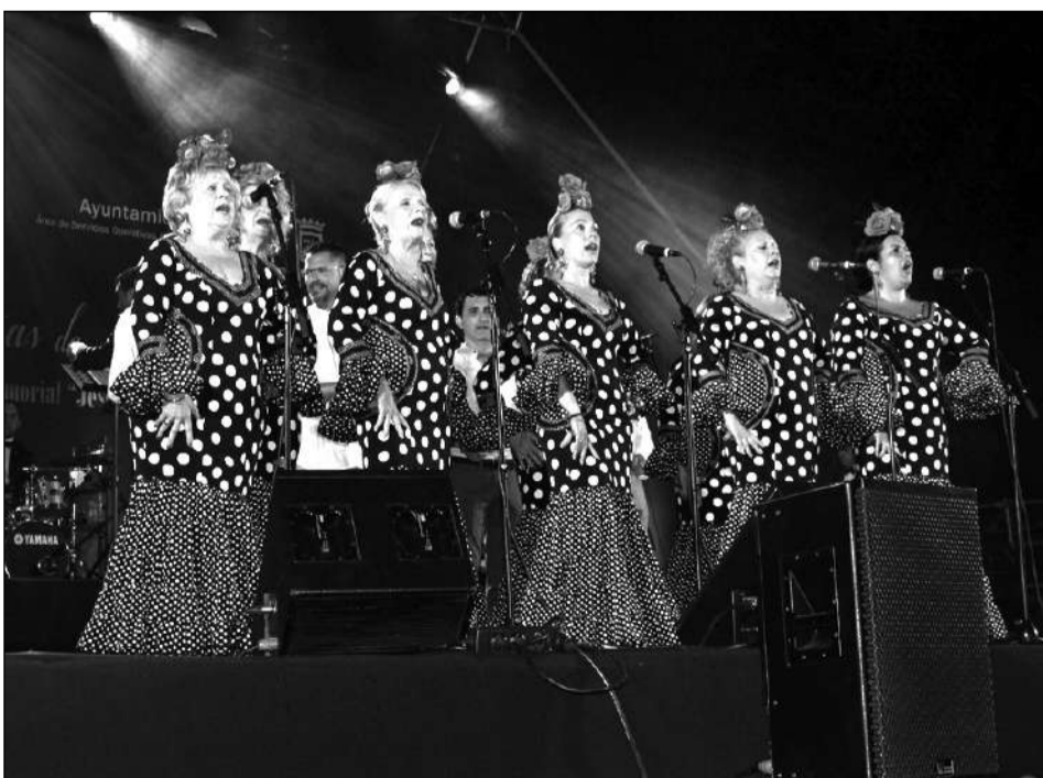
Coro Trébol de Agua.