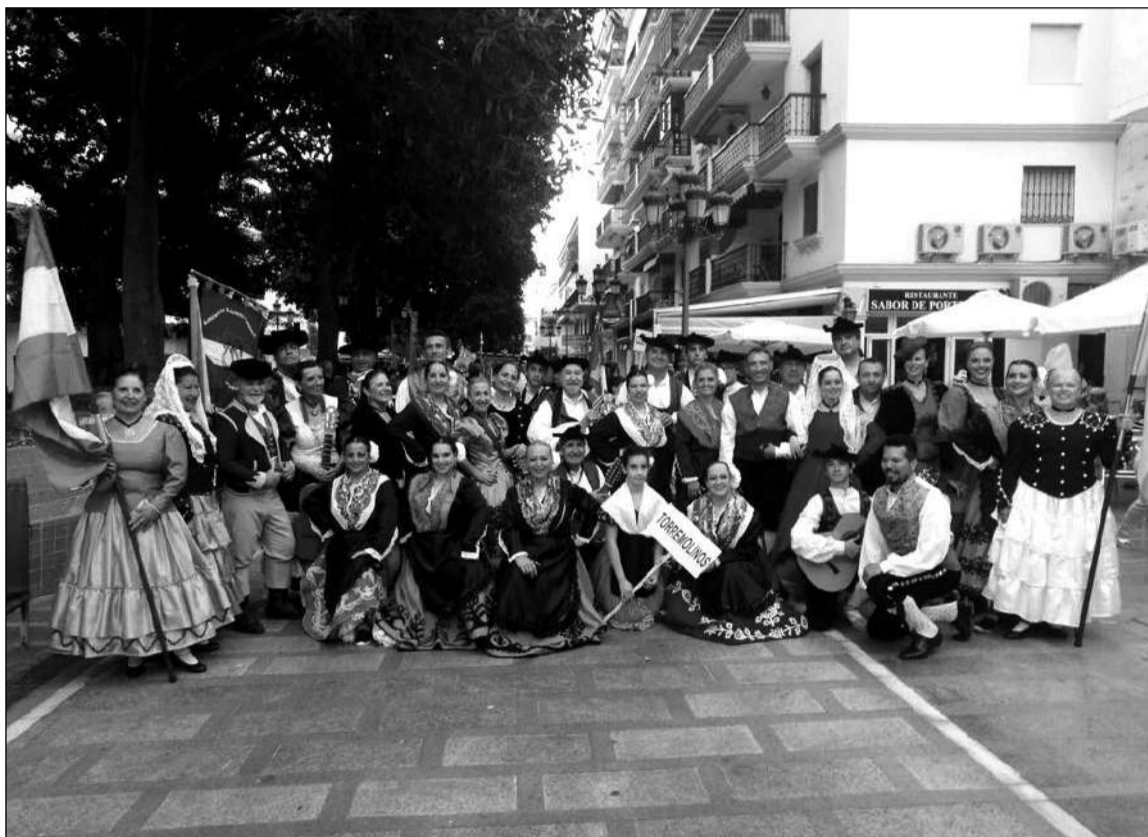
El grupo anfitrión, preparado para hacer el pasacalles.