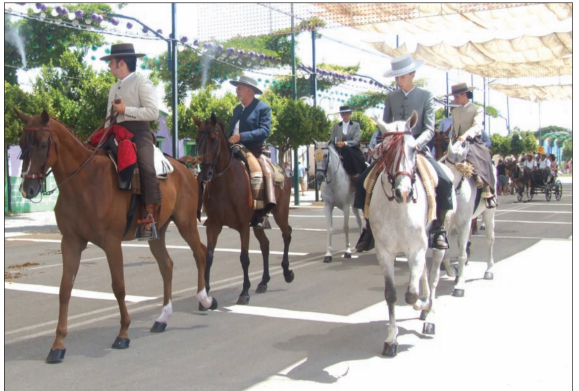
Caballistas y enganches en el recinto ferial de Cortijo de Torres.