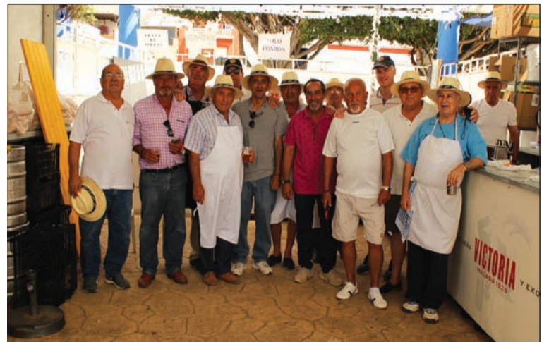
Colaboradores en una de las casetas peñistas.

Asimismo, entre las actividades que se ofrecían destacaban un año más los certámenes de Torneos 3x3 y de Fútbol Base, concursos de repostería, campeonatos de dominó, ajedrez, de la