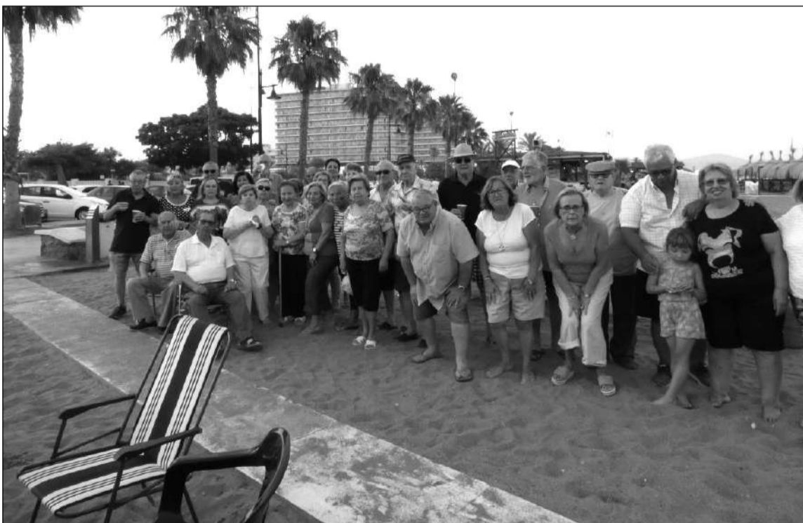
Socios en el paseo marítima de Playamar.