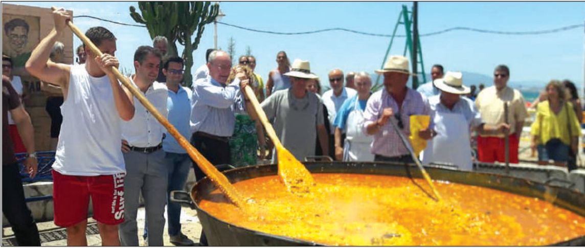
Paella popular de la Peña El Palustre.