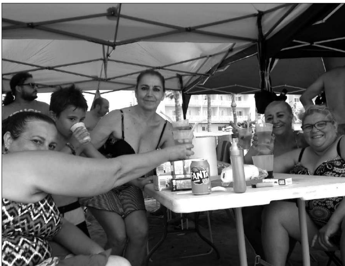
Socias brindan en la convivencia celebrada en la playa.