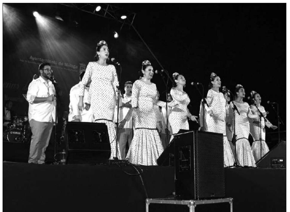
Coro Rociero Nuestra Señora de Gracia.