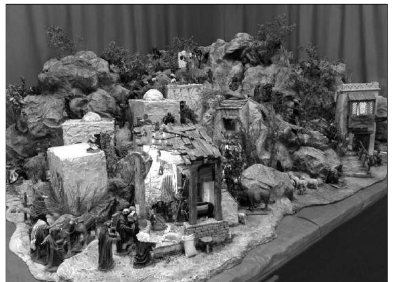
Belén de la Peña El Palustre.