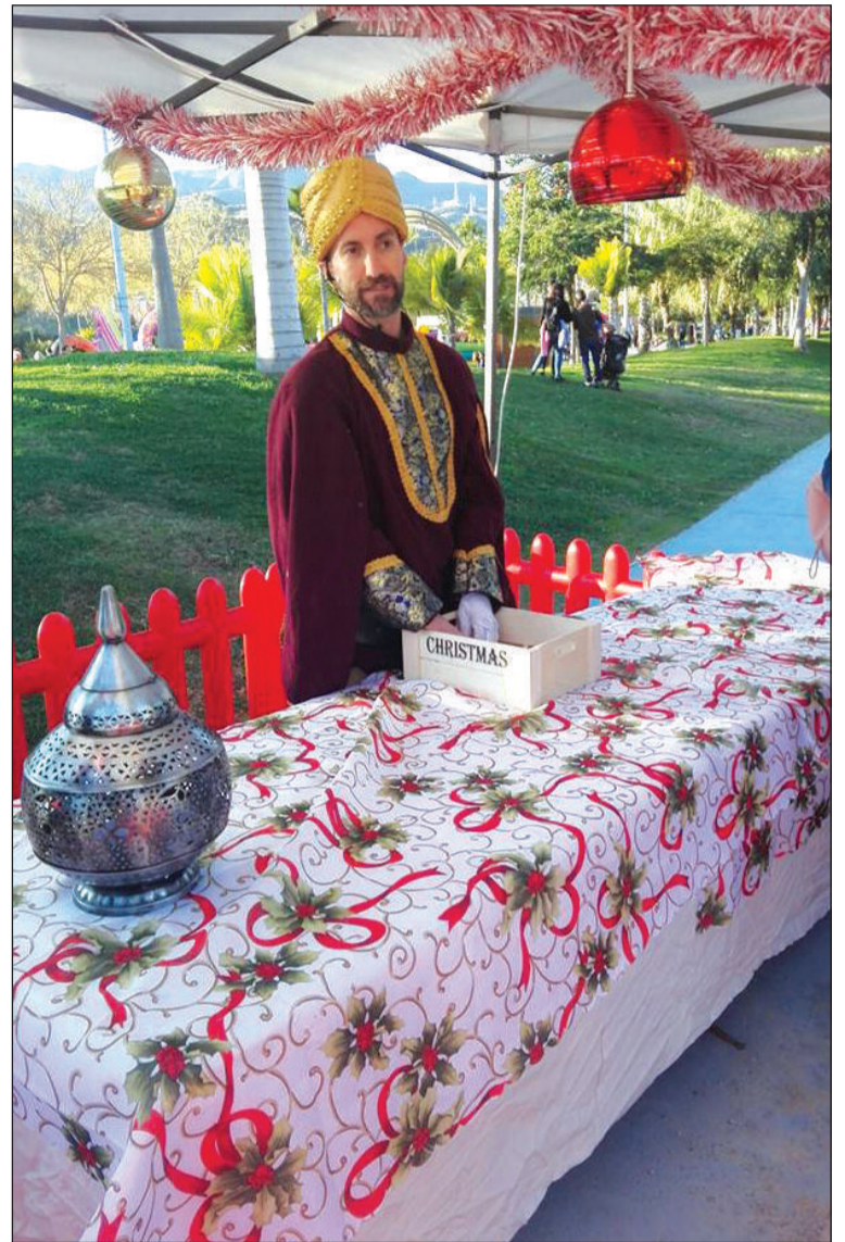
Paje real en la fiesta del distrito Ciudad Jardín.