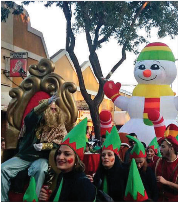
El Rey Gaspar en la cabalgata de Campanillas.