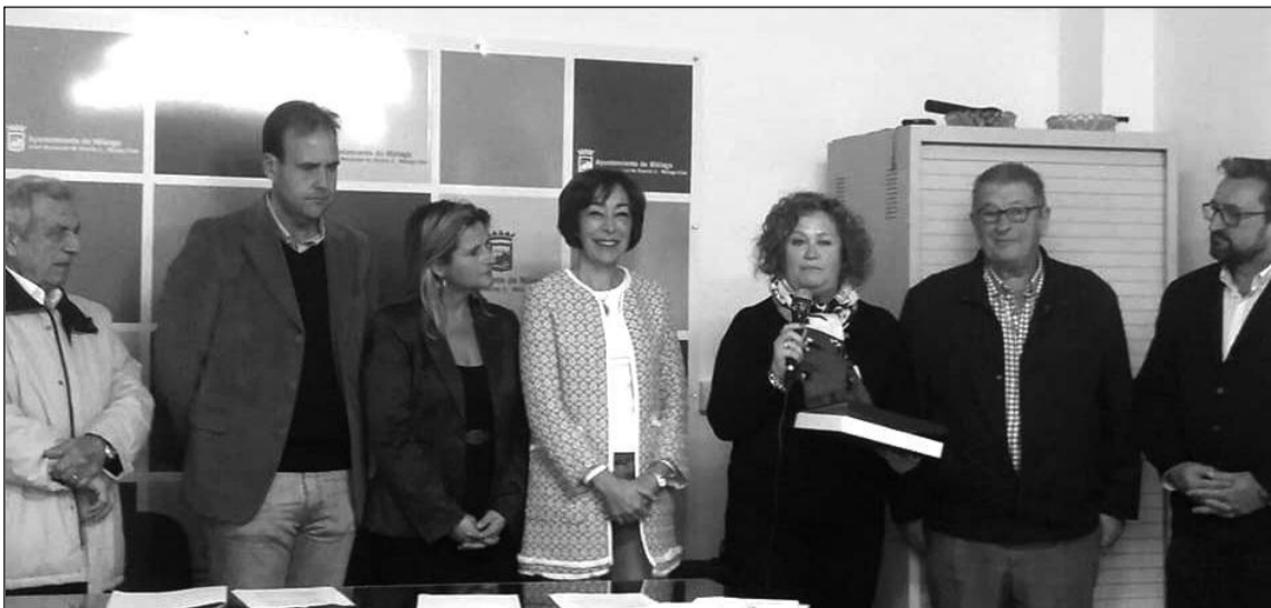
Acto de entrega de premios del concurso de belenes del Distrito Este.