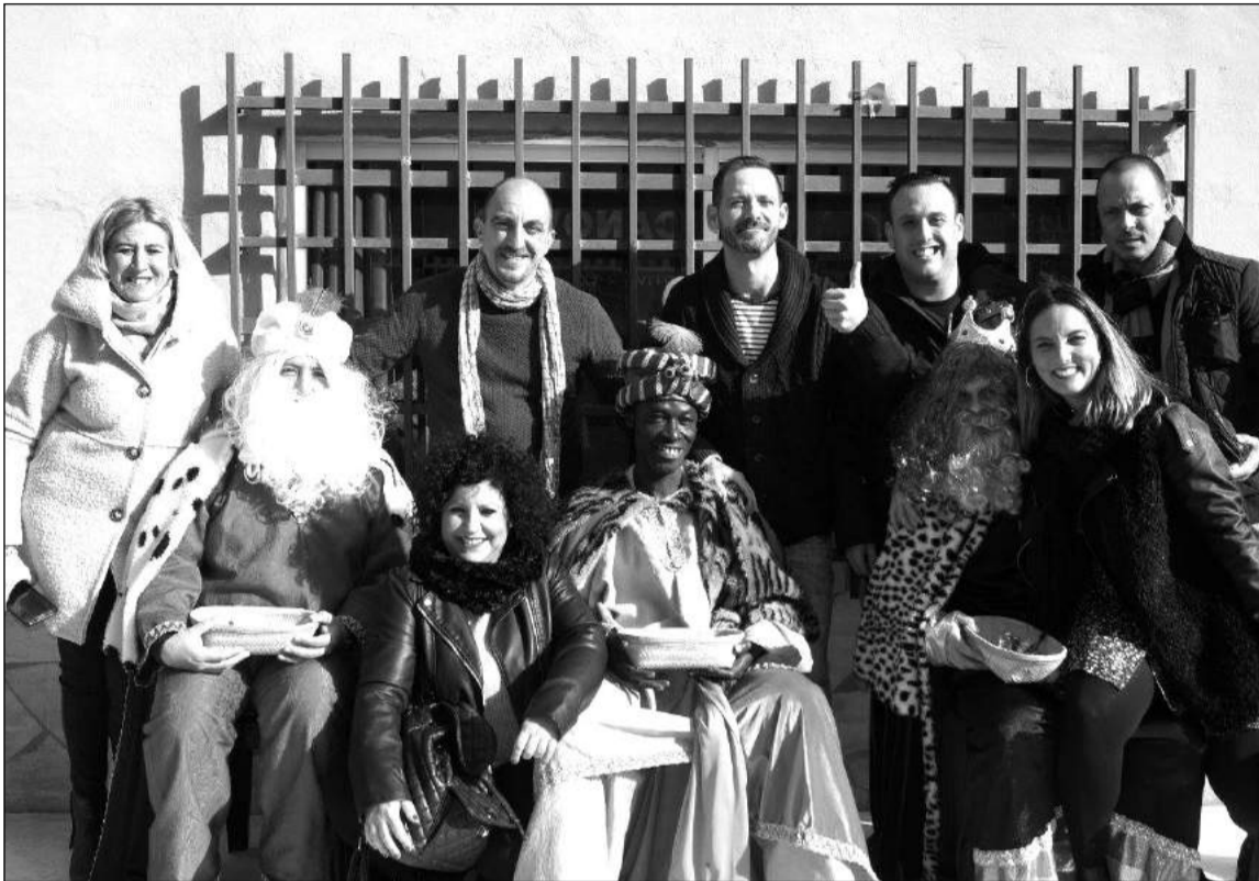
Un grupo de socios con los Reyes Magos en el exterior de la sede.