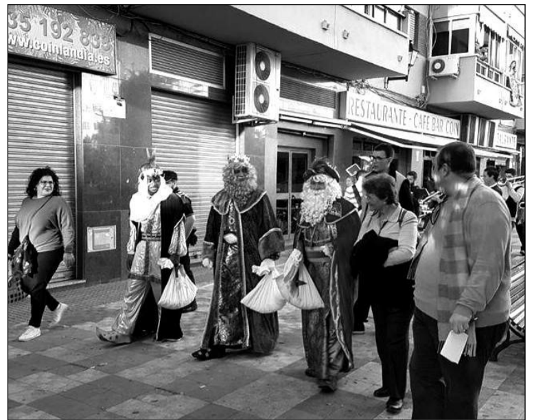
Recorrido de los Reyes Magos por el barrio.