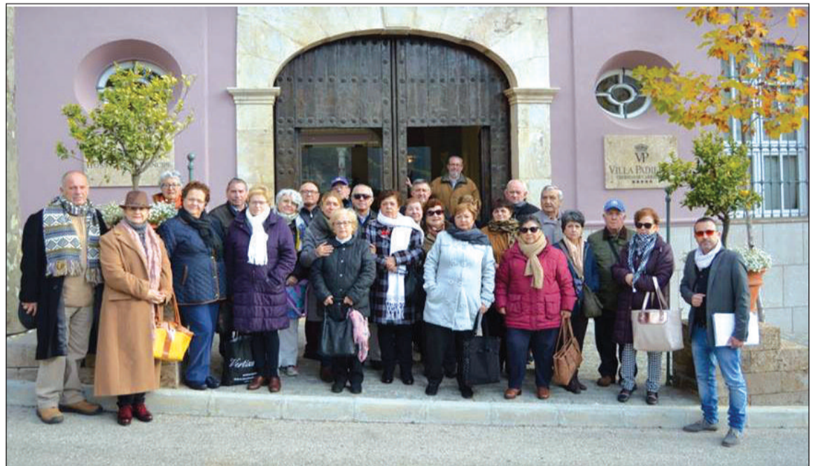
Grupo en el exterior del Balneario de Carratraca antes de tomar los baños.