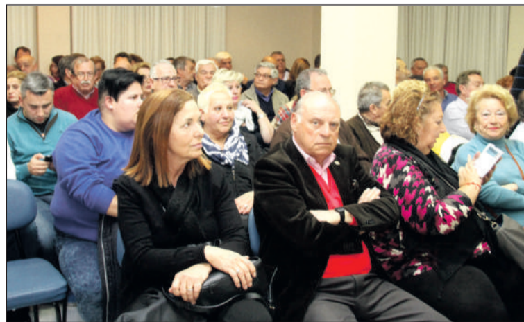
La asamblea volverá a celebrarse en el salón de actos de la Federación.

incluirán aspecto como la lectura del acta anterior, la memoria del ejercicio 2017 y las cuentas del mismo; así como el proyecto de actividades para este año 2018.