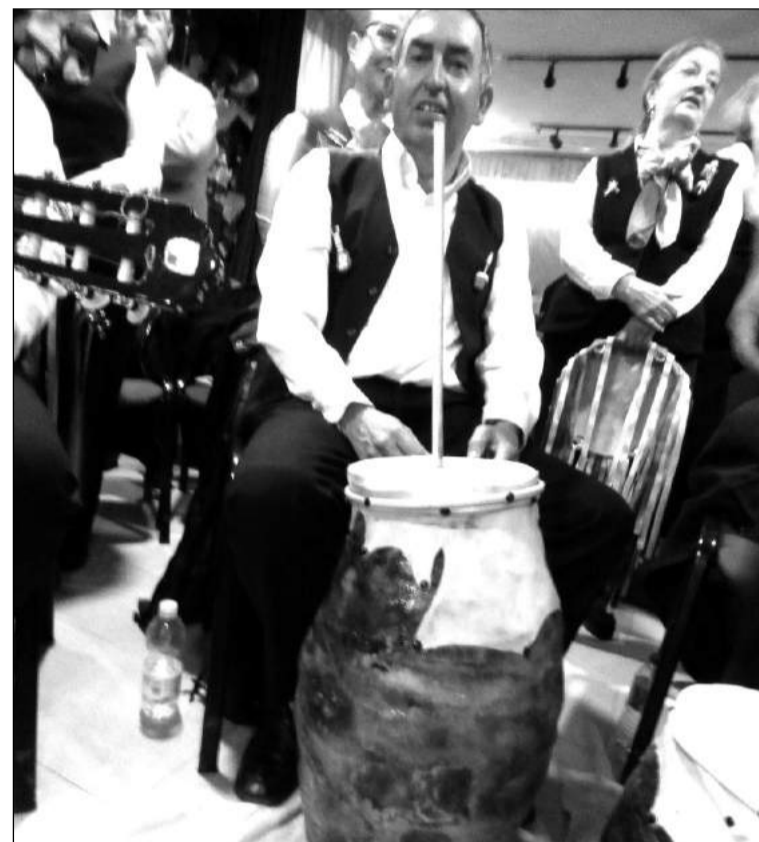
Los villancicos estuvieron muy presentes en el encuentro de coros.