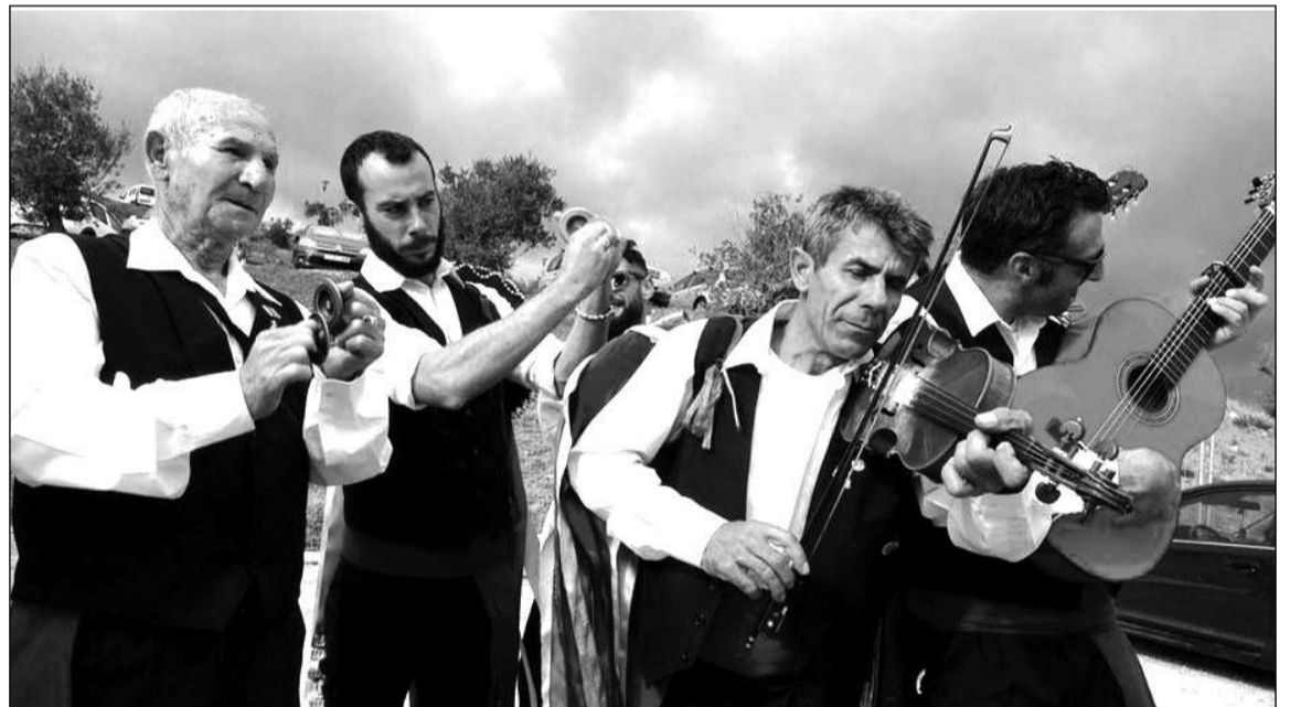
El choque de pandas fue otro de los atractivos de la Fiesta Mayor de Verdiales.