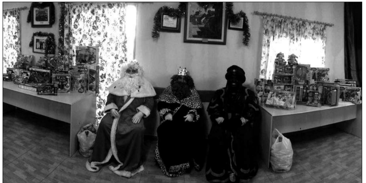
Los Reyes Magos en la sede de la entidad.

niños y niñas que esperaban para entregarles las cartas con sus peticiones. Como no podía ser de otra forma, los regios personajes tomaron las misivas, regalando a la vez a cada pequeño un juguete y un paquete de golosinas como adelanto a la noche mágica del 5 al 6 de enero.