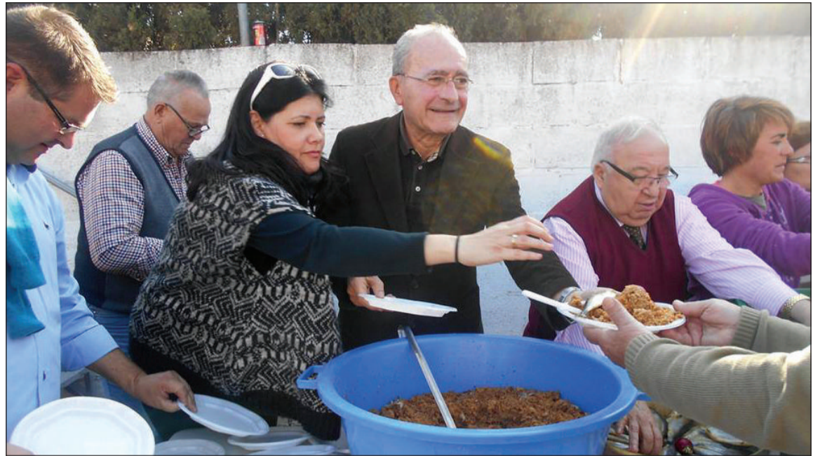
Imagen de archivo de una edición anterior de las Migas de la Peña Colonia Santa Inés.

Con estas Migas, en las que también se contará con las actuaciones de grupos de baile de la Academia de María Elena, la Peña Colonia Santa Inés quiere celebrar también su XLV aniversario fundacional.