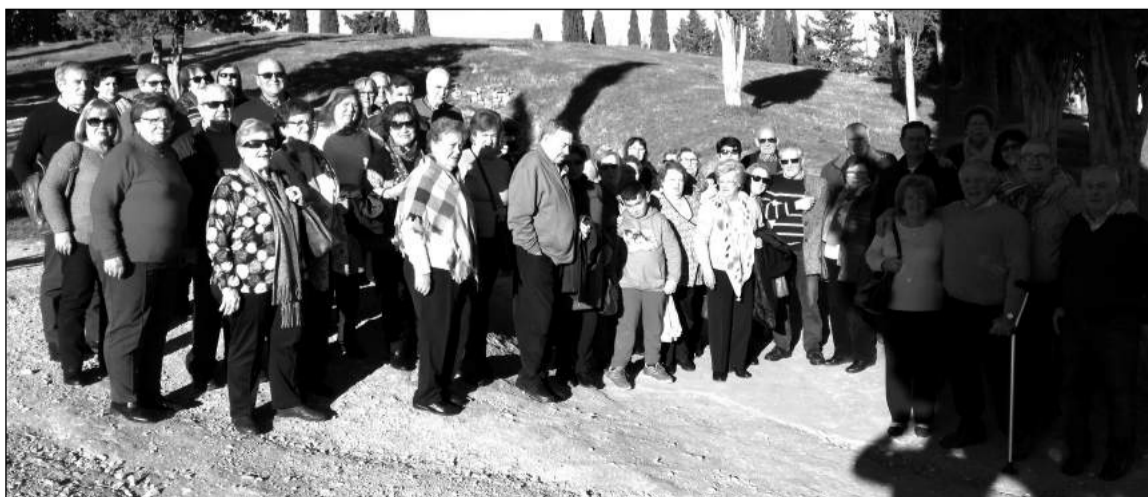
Componentes de la asociación en el conjunto de los Dólmenes de Antequera.

Comenzando 2018 se ha realizado la recogida de cartas para los Reyes Magos en la Asociación de Vecinos, con la participación de más de 80 niños con sus familiares