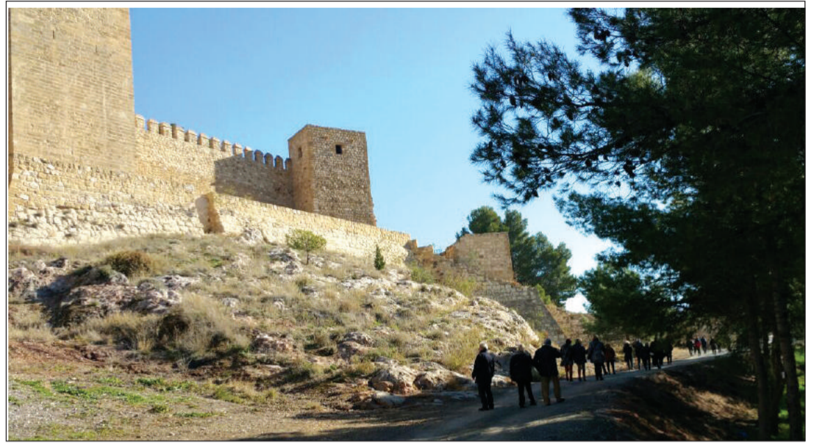
Senderismo en el entorno de la Alcazaba de Antequera.

Se impartía el jueves 21 en la sede de la Federación Malagueña de Peñas por profesionales que ofrecieron a los participantes todo el material necesario para el correcto seguimiento. Este taller incluyó una conferencia sobre nutrición y cultura alimentaria, junto a un curso de soporte vital básico donde los asistentes pudieron practicar con los maniqués las técnicas de recuperación ante una parada cardiorrespiratoria. Además, se entregó una mascarilla en formato llavero a cada asistente, así como un diploma acreditativo de la asistencia y aprovechamiento del curso emitido por los profesionales del 061.