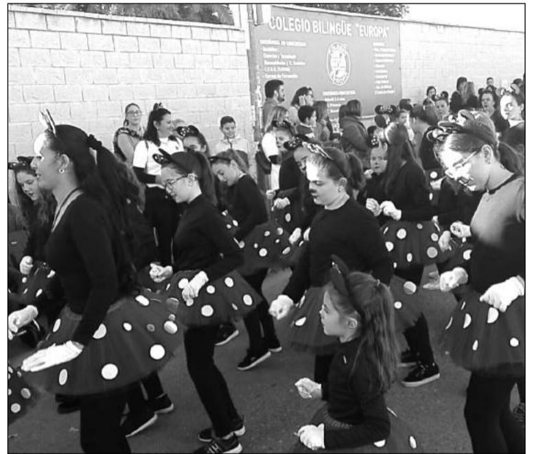
Grupo de zumba en la cabalgata de Puerto de la Torre.

Con tal motivo, se había instalado un escenario en el exterior de la sede, donde los niños recibieron sus regalos de las propias manos de los reyes, en una actividad cargada de ilusión.