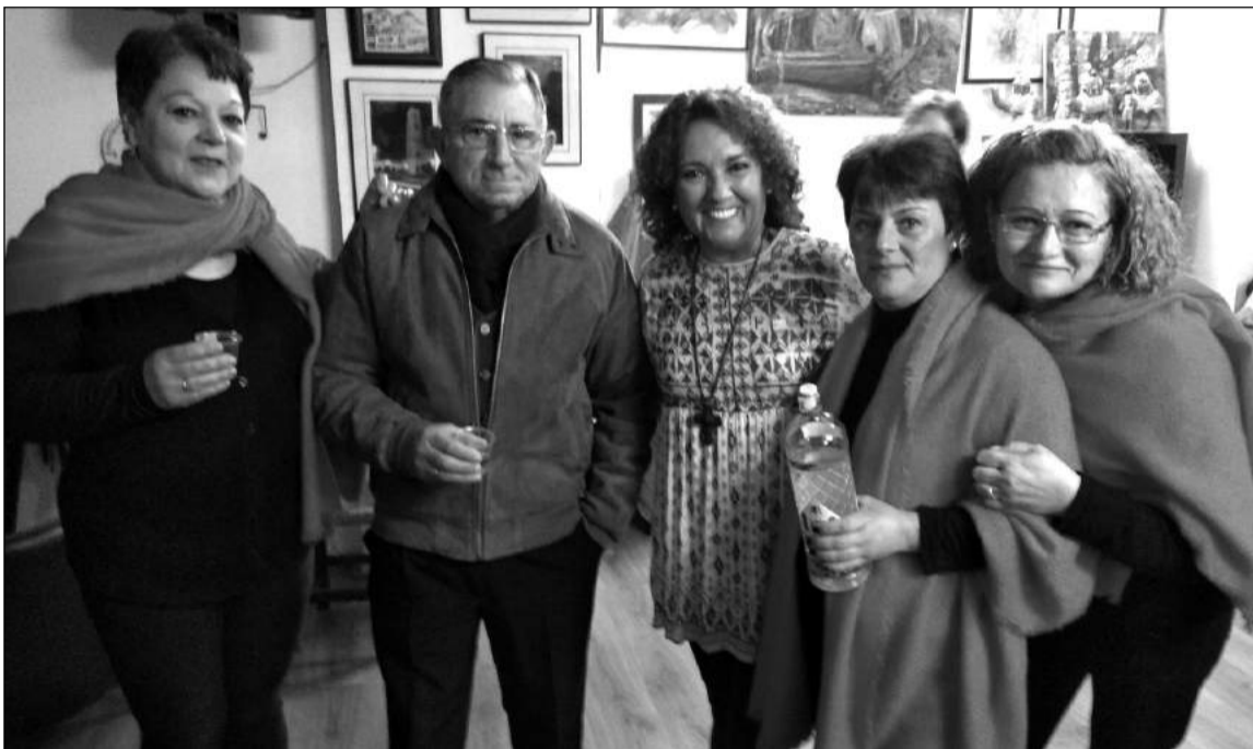
Asistentes al acto celebrado en la sede de la entidad.