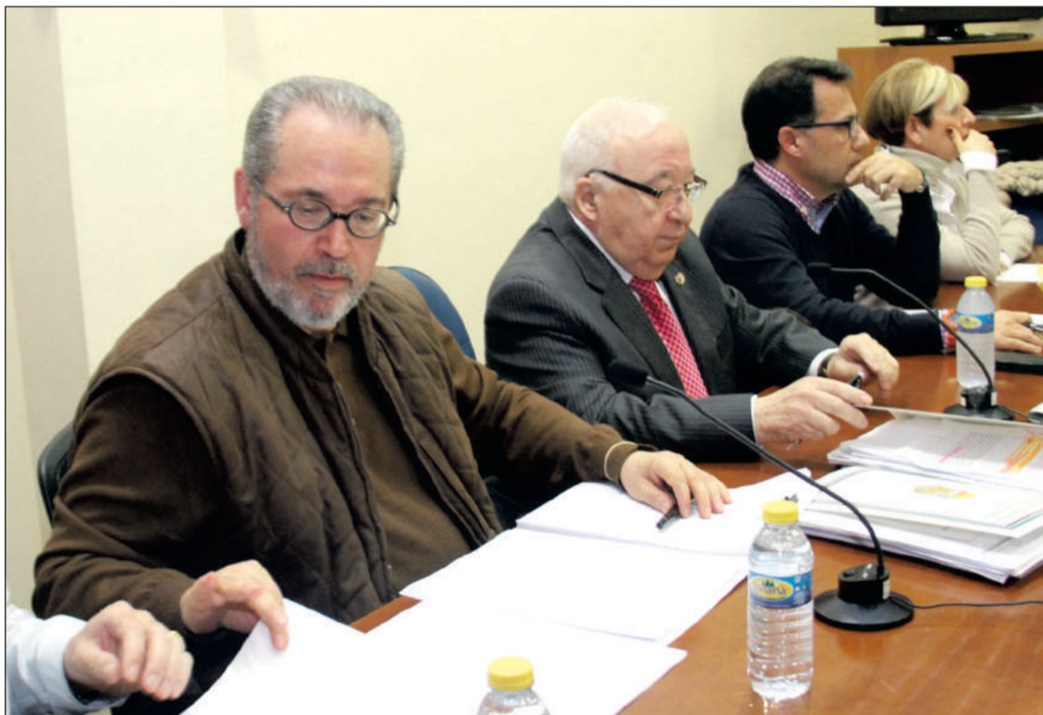
Imagen de la asamblea celebrada en enero de 2017.