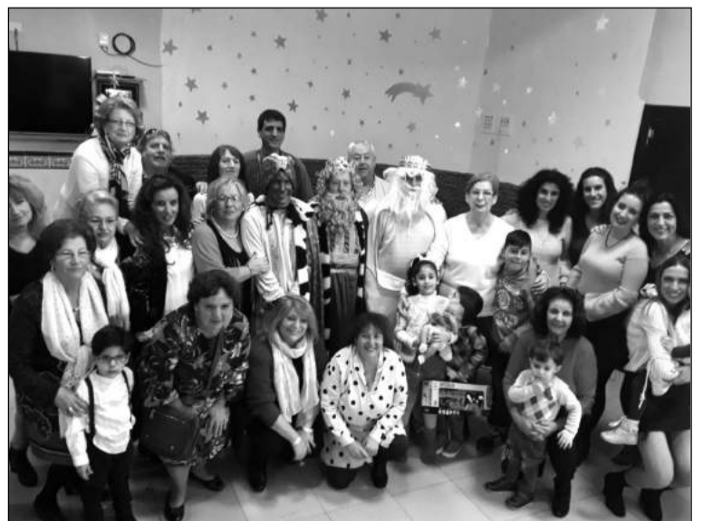
Los Reyes Magos con socios de la peña.

gran afluencia de niños y padres. Melchor, Gaspar y Baltasar llegaron cargados de muchos regalitos y muchos caramelos