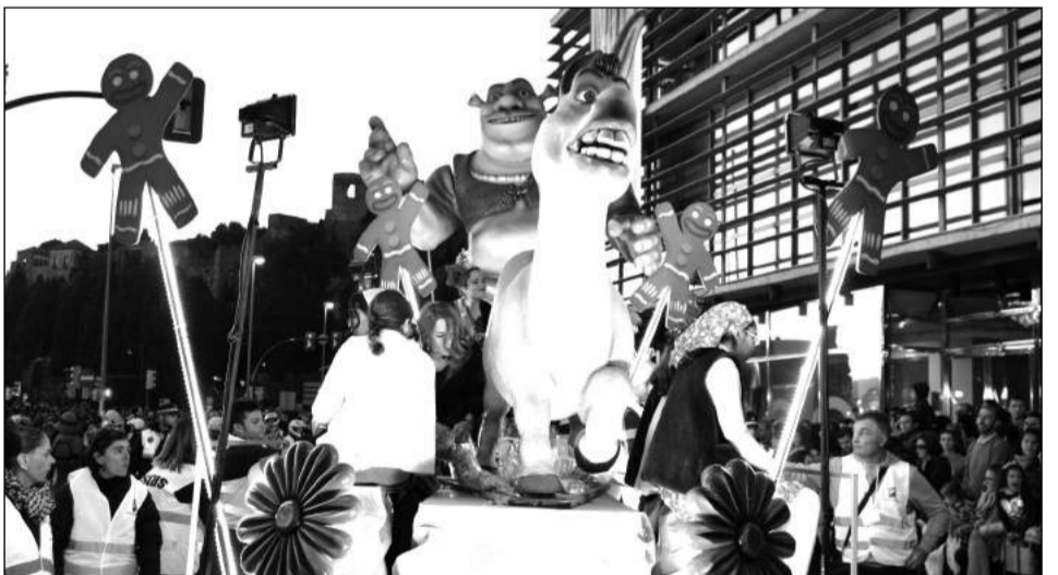
La carroza de la Federación de Peñas estuvo inspirada en la película Shrek.