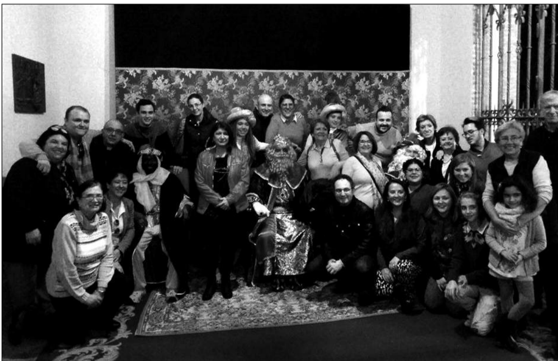
Colaboradores que hicieron posible la visita de los Reyes Magos al barrio.

Contándose con la colaboración de la Cofradía del Amor y la Caridad, uno de los instantes más emotivos de la actividad fue la visita al Santuario de Santa María de la Victoria, donde los Reyes Magos fueron recibidos por un sacerdote.