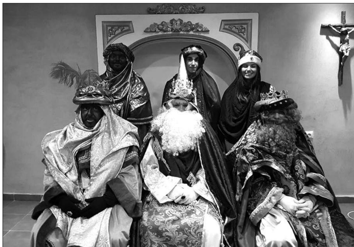
Visita de los Reyes Magos en la parroquia de la Santísima Trinidad.

Se organizaron diversas atracciones para amenizar un acto marcado por la ilusión de todos los asistentes, fundamentalmente de los más pequeños, que tuvieron la oportunidad de saludar personalmente a Melchor, Gaspar y Baltasar, así como de hacerle entrega de sus cartas.