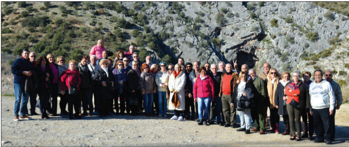
Grupo en el exterior de la Cueva del Gato.