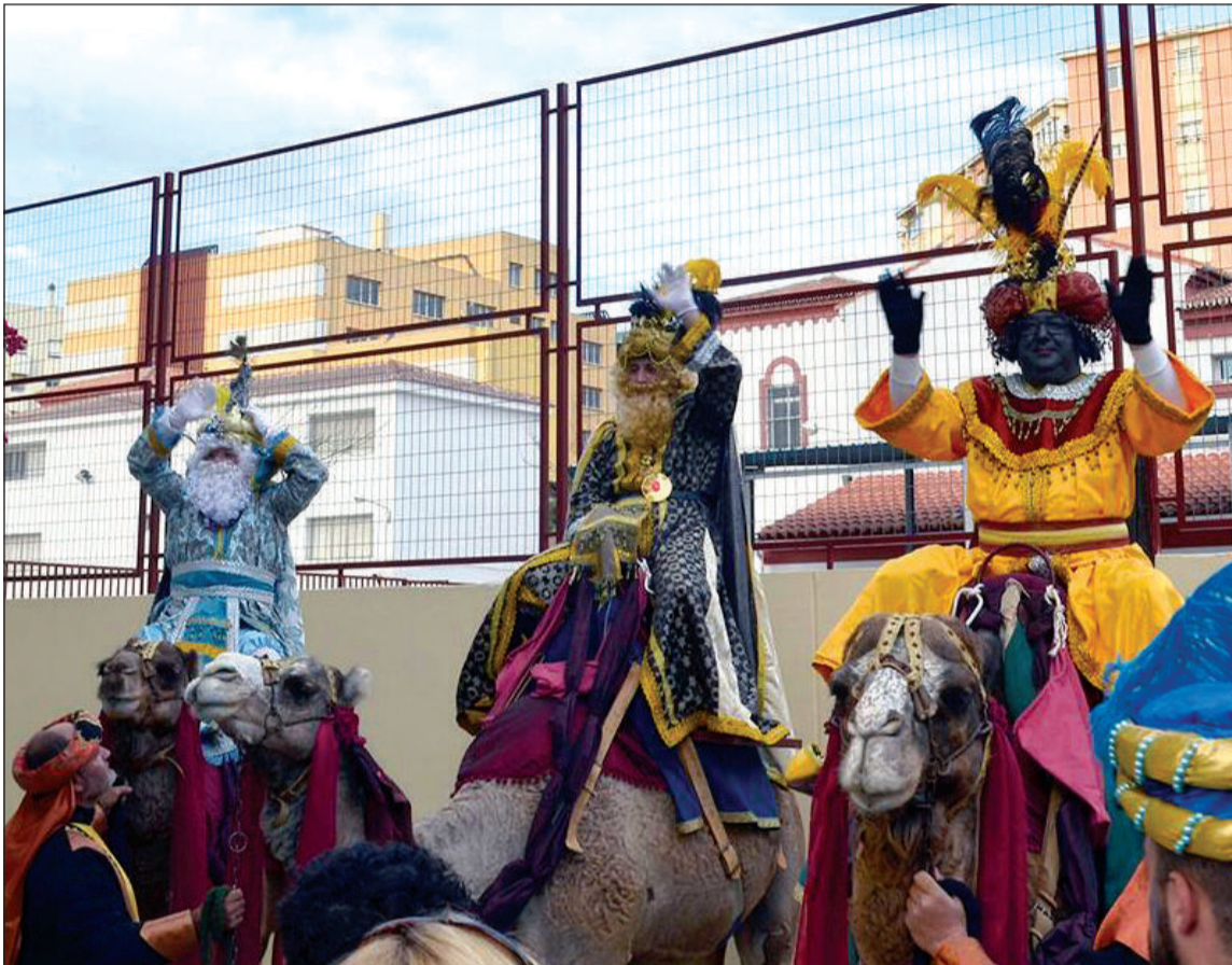
Los Reyes Magos en sus camellos antes de iniciar su cabalgata por Cruz de Humilladero.