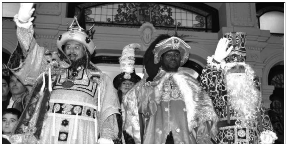
Sus Majestades los Reyes Magos saludan a los niños malagueños.