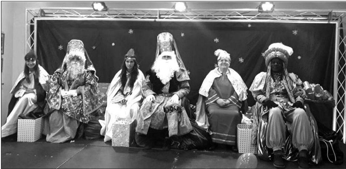
Melchor, Gaspar y Baltasar, acompañados por sus pajes.