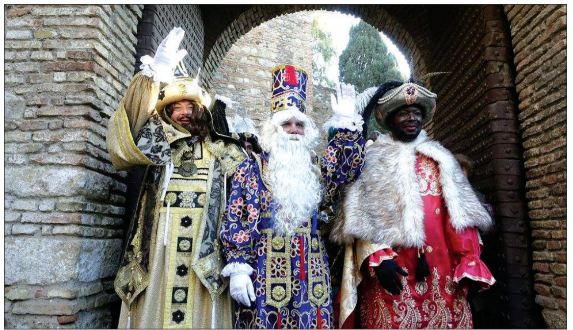
Salida de los Magos de Oriente de la Alcazaba.

de 4 millones de piezas. Además hubo 400 kilos de caramelos sin azúcar y sin gluten que fueron lanzados desde la primera carroza del 'Rey León'. Las carrozas estarán acompañadas por más de 20 pasacalles y grupos de músicas variados que transitaron por las calles en un itinerario, adaptado a las circunstancias de las obras del metro.