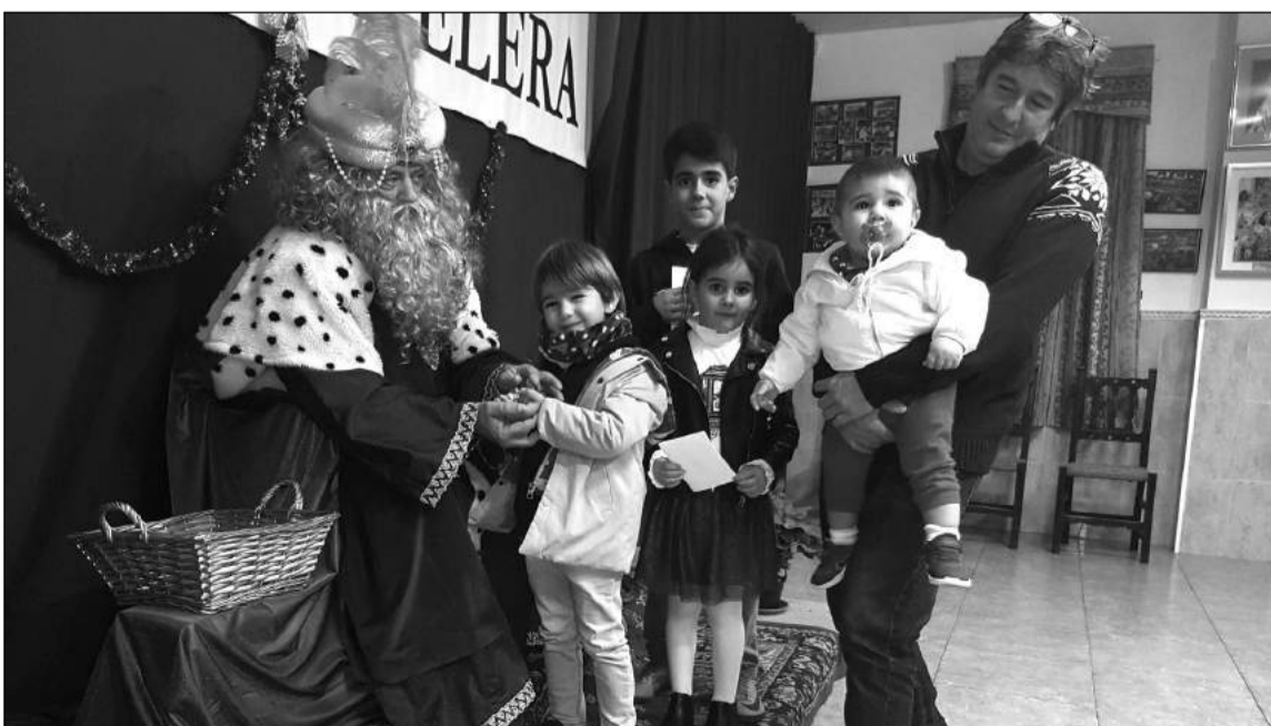
Pequeños junto al Paje Real en la sede de la Peña Perchelera.

los más pequeños y también por algunos adultos que quisieron revivir la magia de estas fiestas en este acto cargado de momentos entrañables.