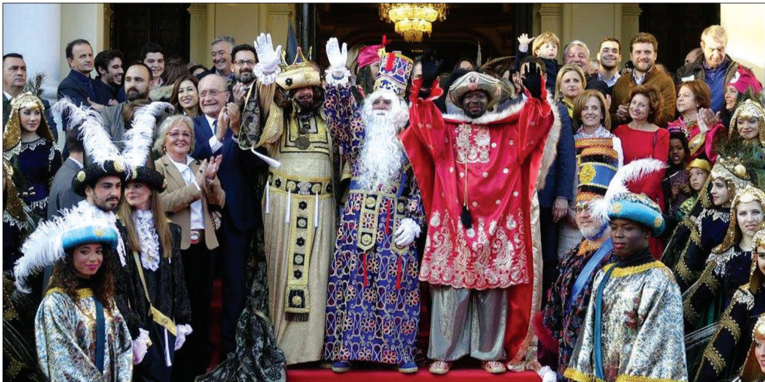
Los Reyes Magos, junto al alcalde y miembros de la corporación municipal, en la escalinata del Ayuntamiento de Málaga.

Número 641 10 de Enero de 2018 C/ Pedro Molina, 1 Tfno: 952 22 54 39 Fax: 952 21 48 82 E-mail: prensa@femape.com - fmpalcazaba@gmail.com Web: www.femape.com Edición digital: www.femape.com/laalcazabadigital Twitter: @FMPLaAlcazaba Facebook: www.facebook.com/FMPLaAlcazaba