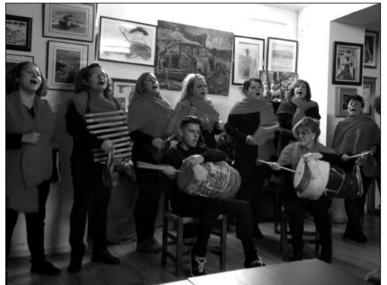
Pastoral del Amor y de la Vida.