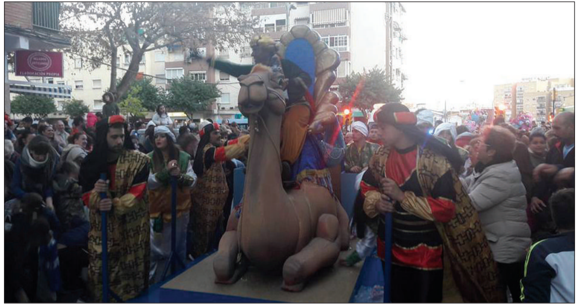
Tradicional cabalgata en Bailén Miraflores.

grosa y finalizaba con photocall navideño, globoflexia y cañón de nieve en el CEIP Valle Inclán.