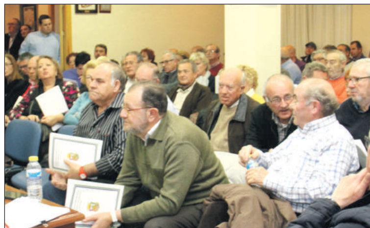
Representantes de las entidades federadas.

En lo que se refiere al orden del día, se recogerán diferentes puntos de interés para todas las entidades que componen este colectivo. De este modo, se