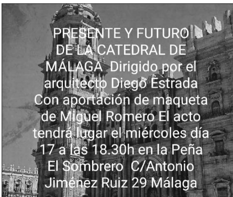
Conferencia sobre la Catedral de Málaga.