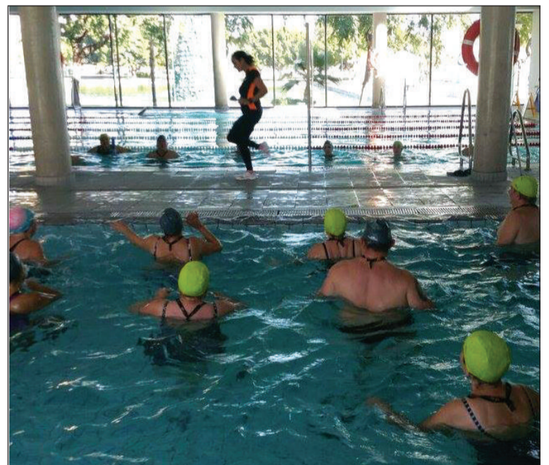
Ejercicios acuáticos en Go Fit con componentes de las peñas malagueñas.

Se han organizado una serie de actividades variadas donde la