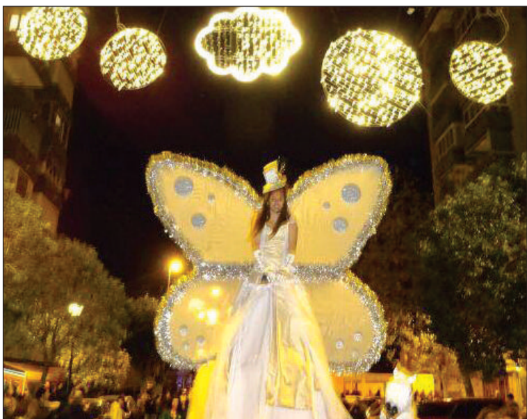
Desfile en el Distrito Málaga Este.

Finalmente, el 5 de enero, d forma paralela al Centro Histórico, el pasacalles de Reyes de Churriana recorría varias calles del distrito y finalizaba con un encuentro en la plaza de la Inmaculada. El mismo día un desfile recorría las calles de Campanillas desde las 17:30 horas; mientras que el 4, 5 y 6 de enero tres desfiles tenían previsto recorrer diferentes zonas de Teatinos.