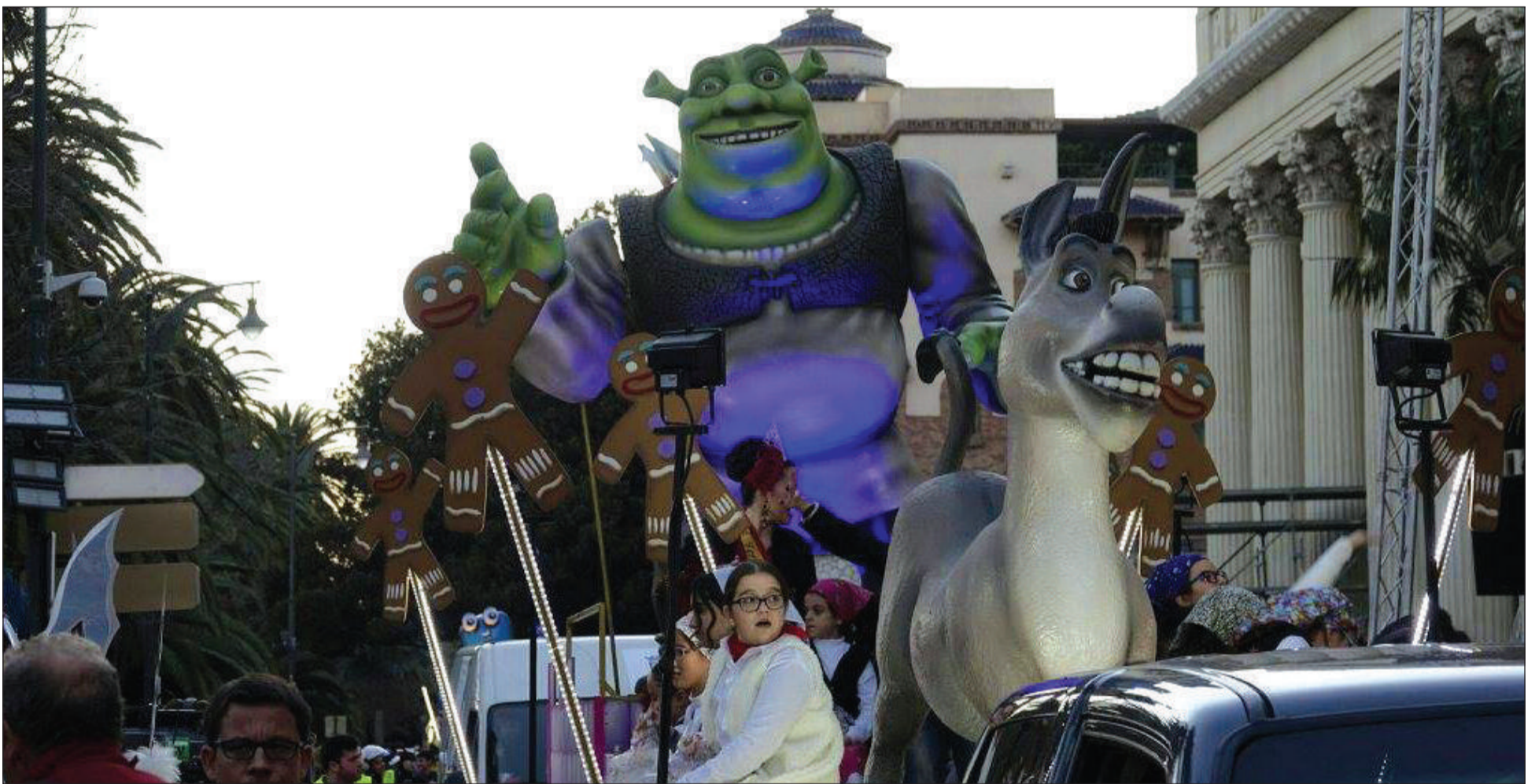
Carroza de la Federación Malagueña de Peñas en el inicio del cortejo en el Paseo del Parque.

En este caso, se contaba con la participación de la Pastoral de una entidad federada como es la Peña Los Penosos, que ofrecía sus villancicos en la parte central de la cabalgata, la relativa a la natividad. Así, se situaba delante de esta carroza, interpretando villancicos populares.