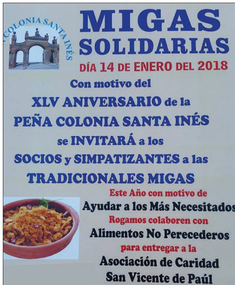
Detalle del cartel editado por la entidad.