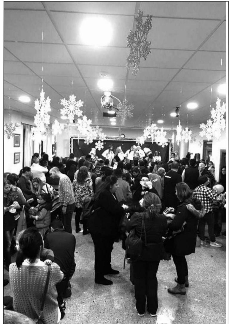
Aspecto que presentaba la sede con la visita de los Reyes Magos.

La Peña Finca La Palma está preparando una nueva actividad para el mes de febrero, con la celebración de San Valentín en un hotel de Torremolinos.