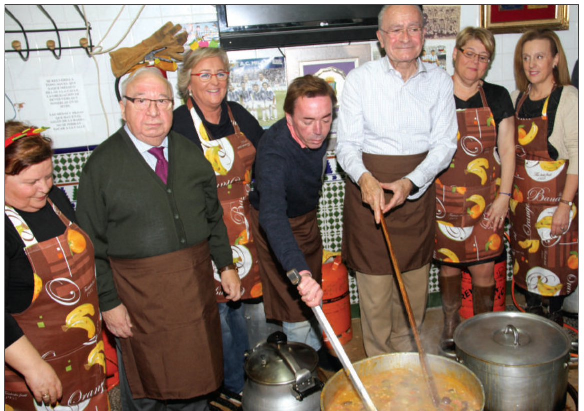
Preparativos de la Berza Carnavalesca del pasado año, con invitados.

El reclamo de un buen potaje de berzas, preparado como cada año por los propios socios de la Peña Cortijo de Torre, y una gran sesión de coplas de carnaval es motivo más que suficiente para acudir a la Berza Carnavalesca y no faltar a esta gran cita con murgas y comparsas.