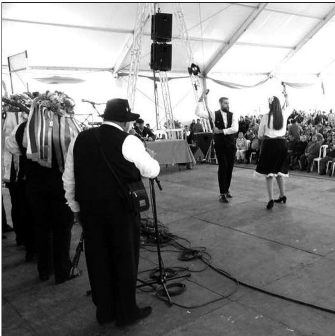
Una de las pandas sobre el escenario.