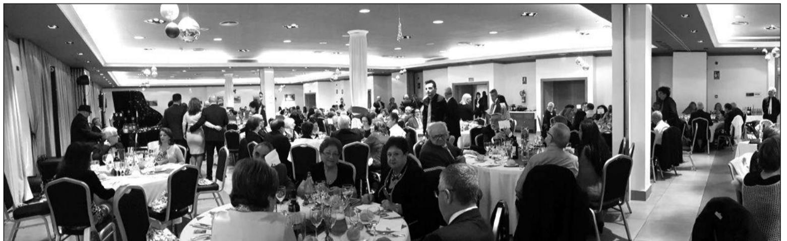
Celebración de la Nochevieja de los socios de la Agrupación Cultural Telefónica.