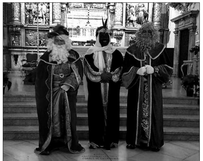
Sus Majestades en el Santuario de la Victoria.