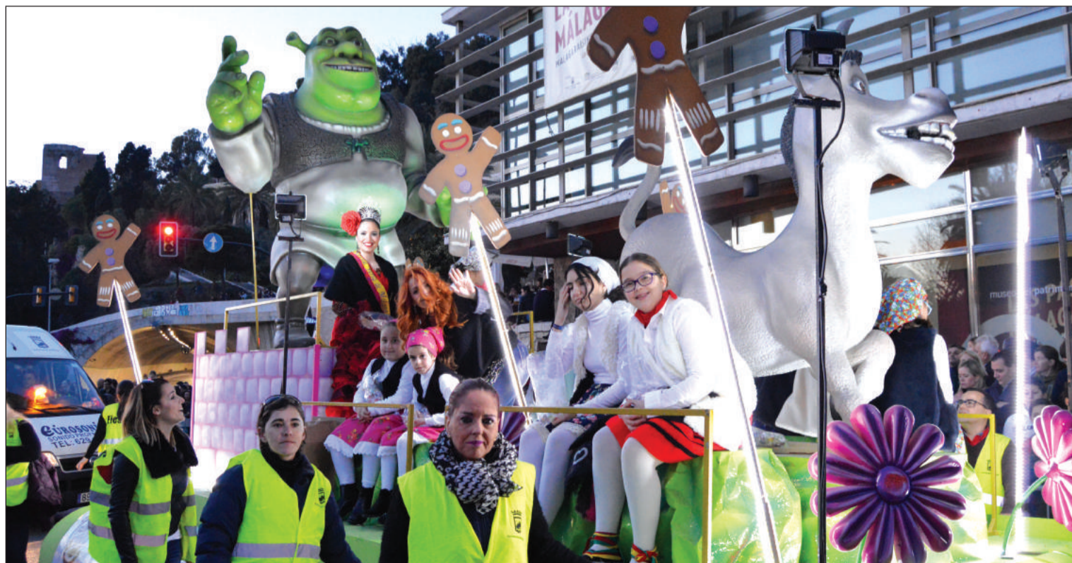
Carroza de la Federación Malagueña de Peñas, inspirada en la película de Disney Shrek.

La Peña Flamenca Ciudad Puerta Blanca inicia el próximo 13 de enero el XXIX Concurso de Cante Flamenco Ciudad de Málaga 'Memorial José Martín Carpena', que cuenta con más de 5.000 euros en premios. El certamen cuenta con un total de cuatro preliminares, que se celebrarán en la sede situada en la avenida Gregorio Diego. La final está programada para la noche del 10 de febrero.