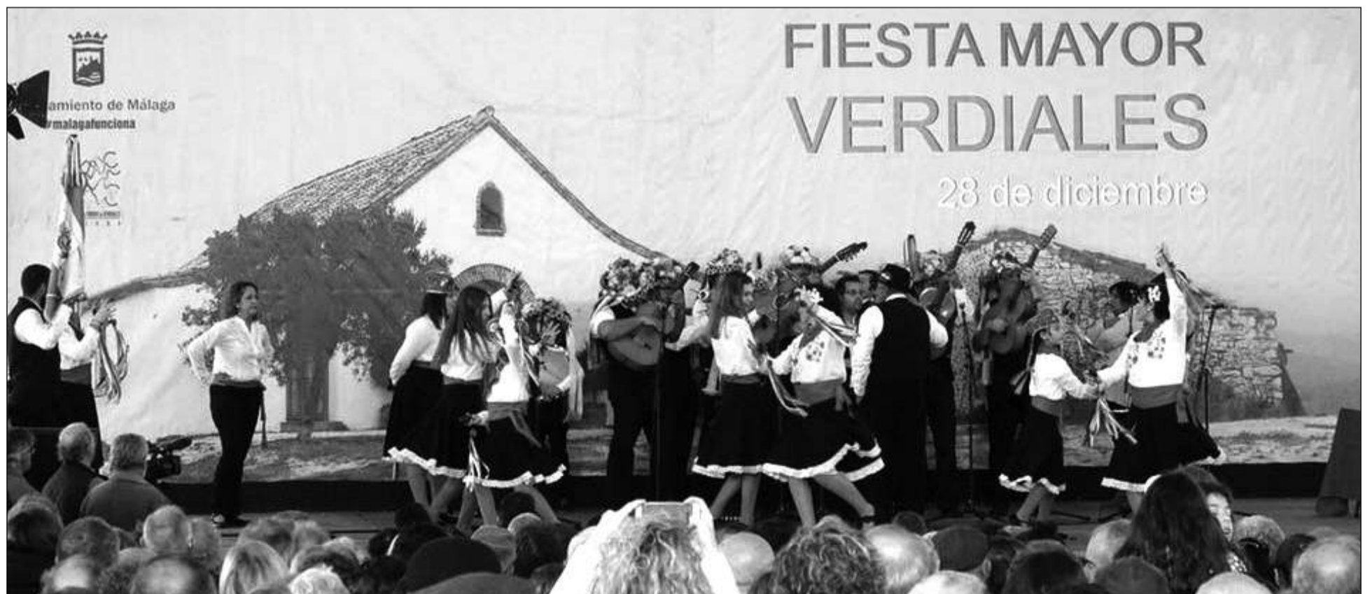
Actuación de una de las 26 pandas de verdiales participantes el pasado 28 de diciembre en la Fiesta Mayor celebrada en el recinto ferial del Puerto de la Torre.