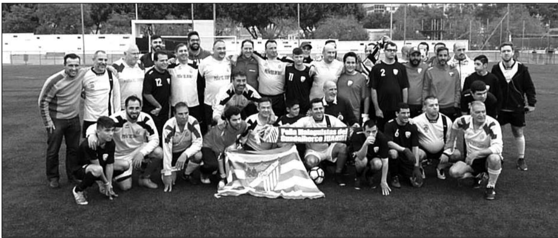
Integrantes de la Peña El Duro y el C.D. Málaga Siempre Fuerte.