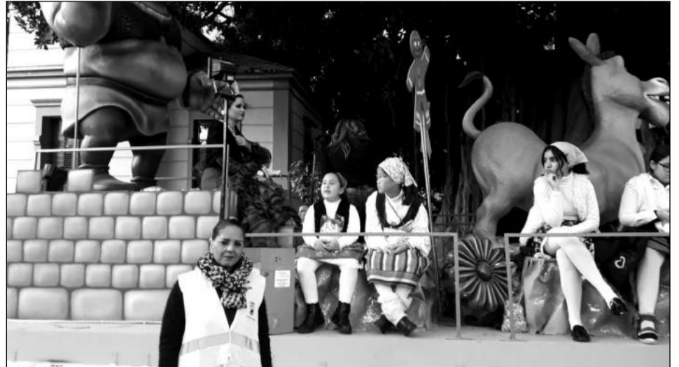
Carroza de la Federación Malagueña de Peñas, en el inicio del recorrido de la cabalgata.