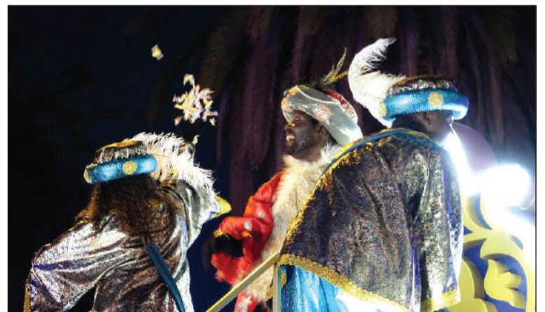
El Rey Baltasar en su carroza.