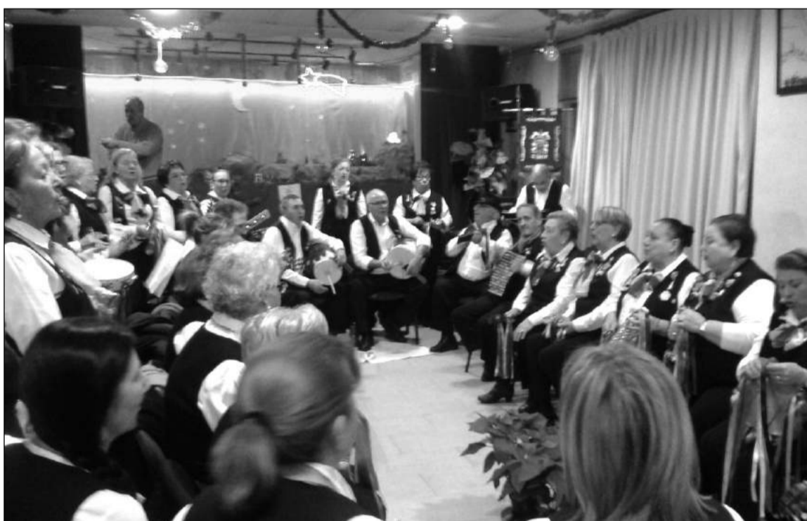
Actuación de uno de los coros en la sede de la Casa de Melilla.