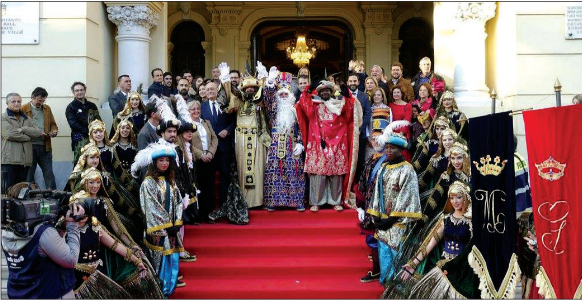
Los Reyes Magos, junto a la corporación municipal en la puerta del Ayuntamiento.