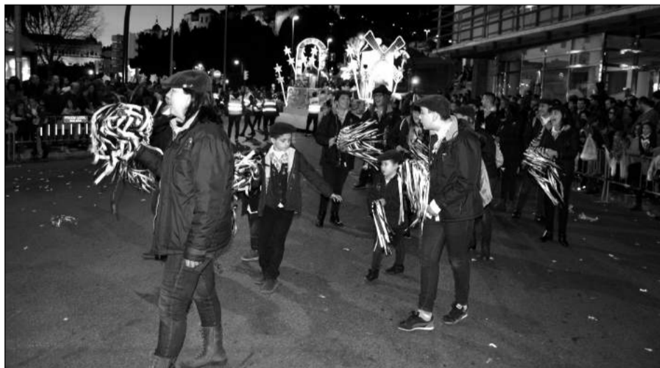
Pastoral de la Peña Los Penosos en el pasacalles.