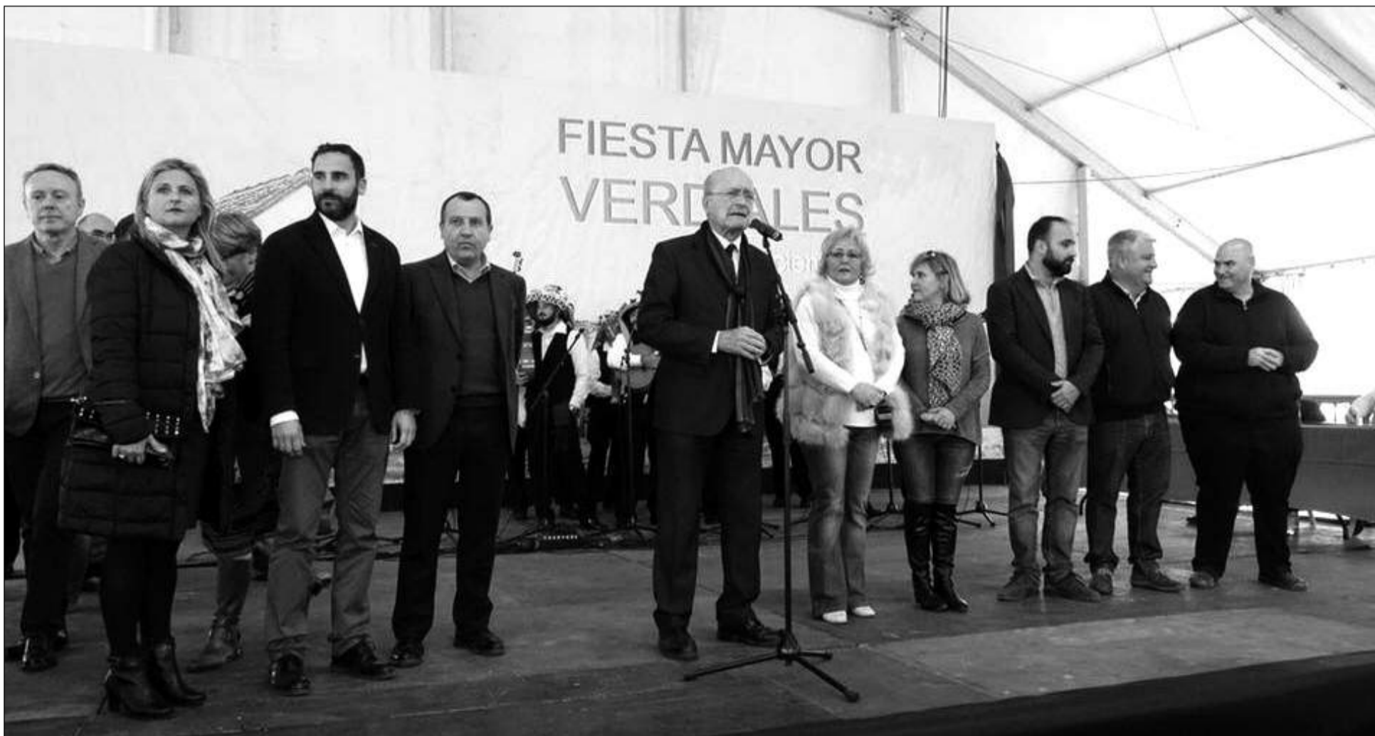
Intervención del alcalde junto a otras autoridades asistentes al acto.

Los estilos concursaron de forma consecutiva por el siguiente orden: Montes, Almogía y Comares. El estilo Montes fue el que congregaba más pandas. Fueron un total de 14, de las cuales 8 participaron a su vez en los choques que se realizaron paralelo al concurso. Almogía y Comares citaron a 6 pandas. El sorteo del orden de actuación de las pandas se realizó el sábado 16 de diciembre en la Glorieta del Fiestero, en el Paseo del Parque.