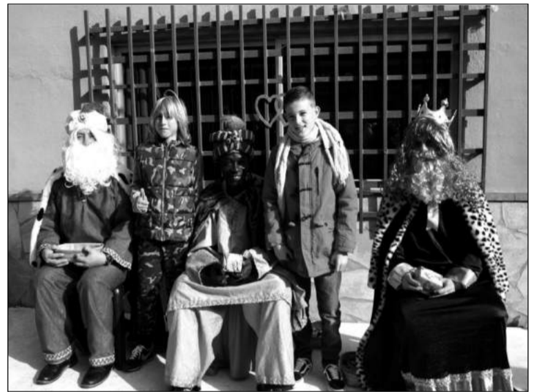
Niños con Sus Majestades.