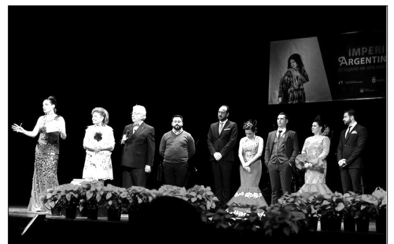
Final del certamen de copla del pasado año en el Cervantes.