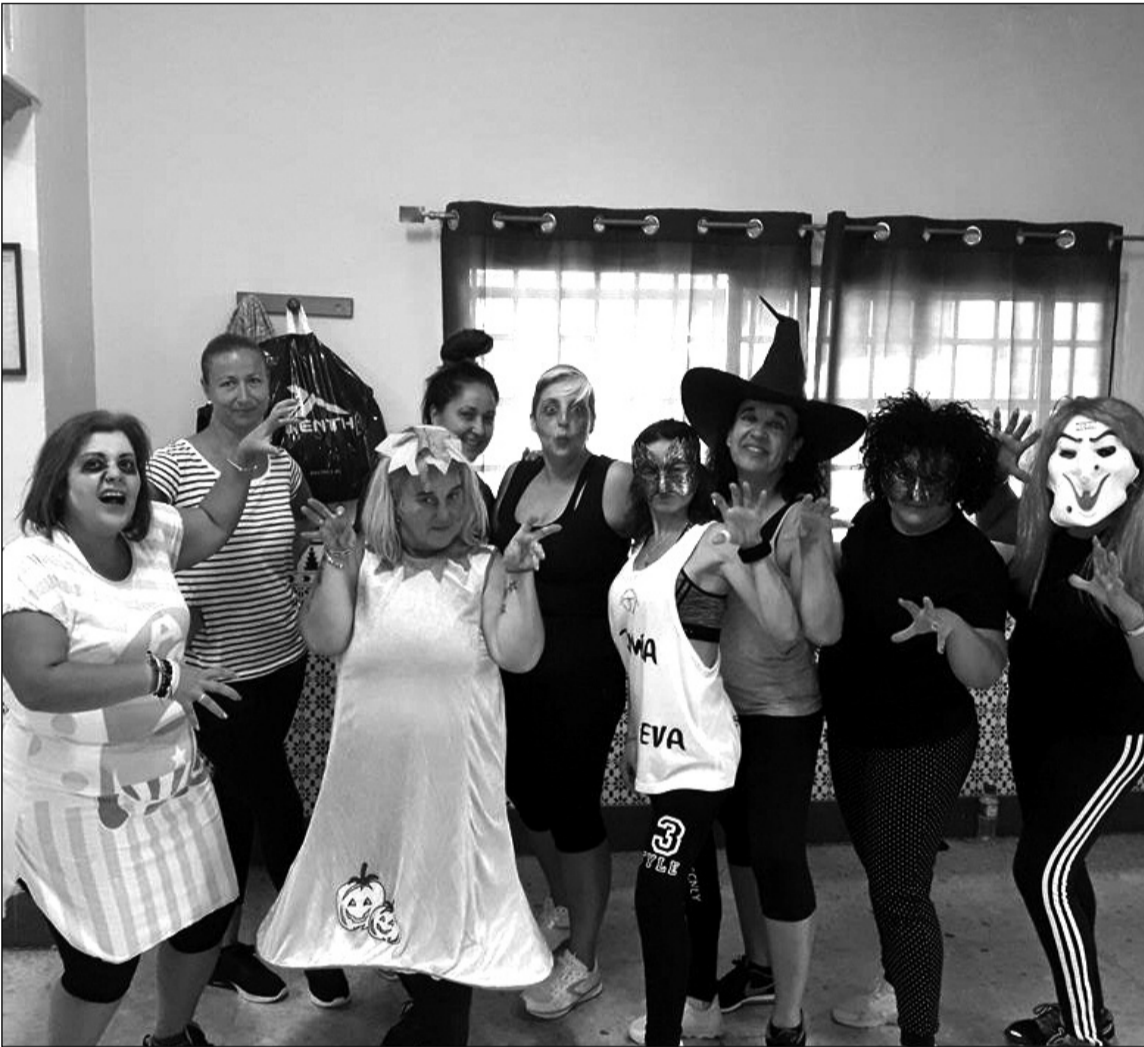
Grupo de socias disfrutando en la sede.