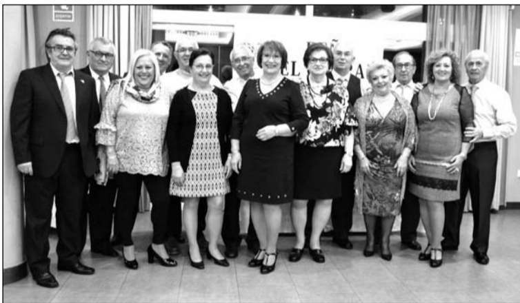
Grupo de socios en Cortijo Chico.