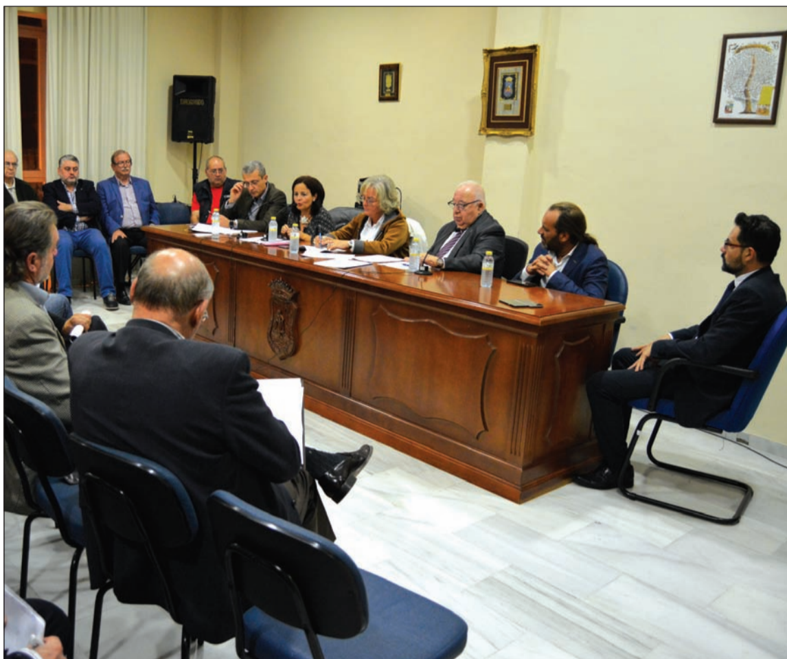
Un instante de la reunión del pasado lunes con los presidentes de las entidades.