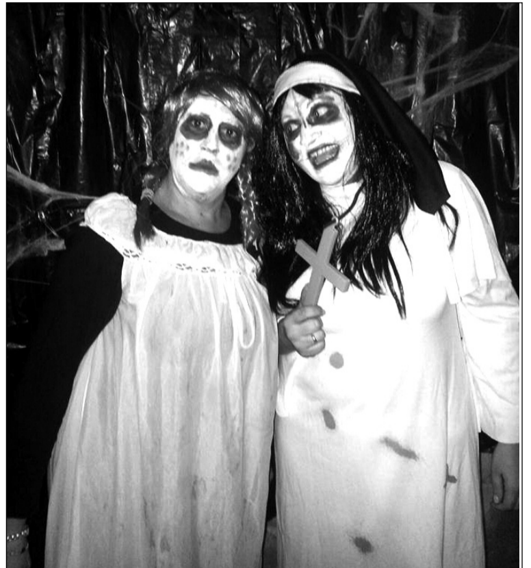
El terror estuvo presente en toda la velada.

El buen ambiente y la hermandad fue la nota predominante de una actividad en la que el buen humor se hizo presente en la sede de la Peña Los Corazones.