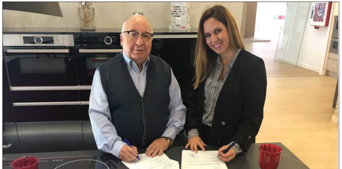
La firma se realizó en la exposición de cocinas de Tesesa.

Esta renovación del convenio de Tesesa se une a las rubricadas recientemente con otras firmas como Coca-Cola, Cerveza Victoria o Diario Sur, empresas que de este modo ratifican su colaboración con el colectivo peñista.