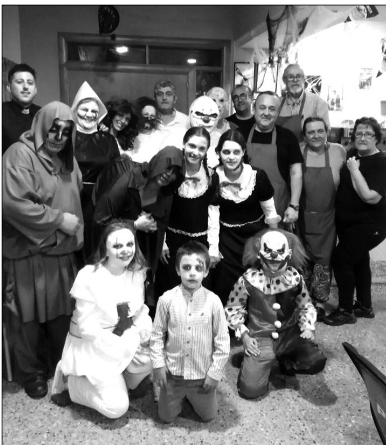
Grupo de socios disfrutando de la noche de Halloween.