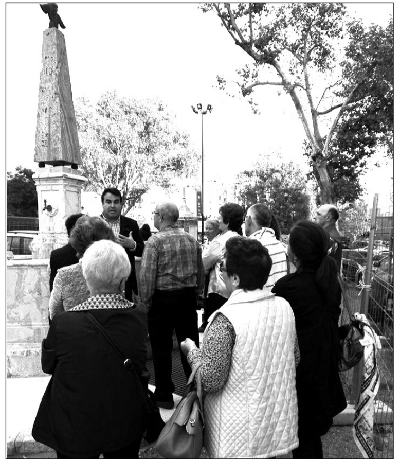
Taller de Historia de Málaga en el cementerio de San Miguel.

Tampoco pasaba desapercibida su fiesta de Halloween 2017,