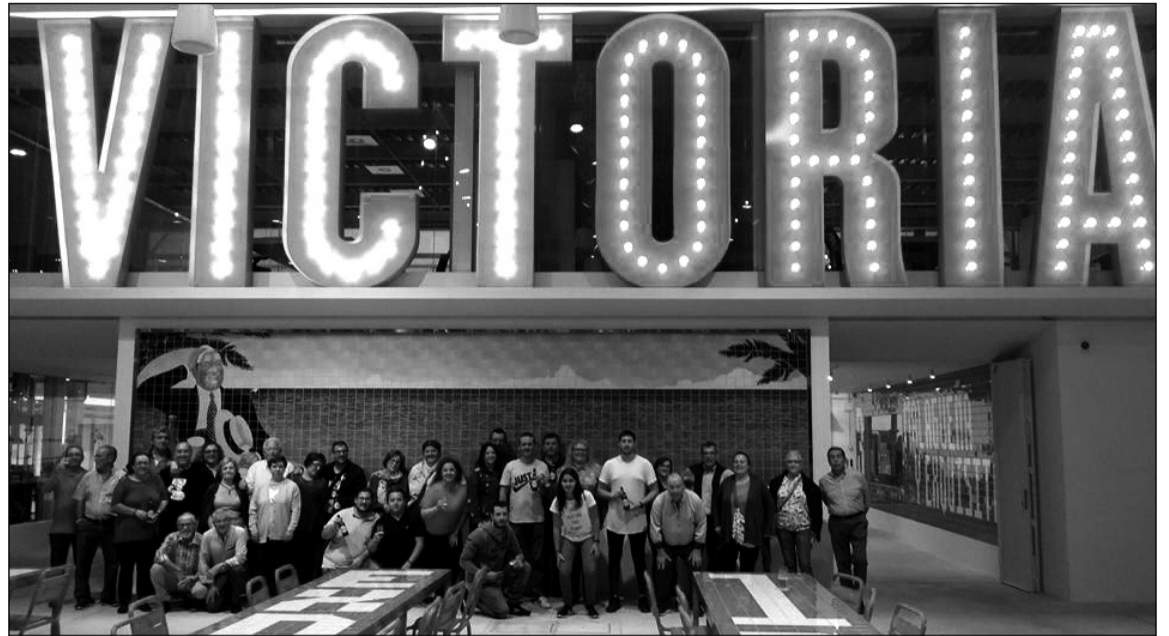
Visita de los socios a las instalaciones de Cerveza Victoria.

Además, dentro de su amplio programa de talleres y cursos se ha añadido en las últimas semanas uno dedicado al pilates, que está teniendo una buena aceptación por parte de los socios.