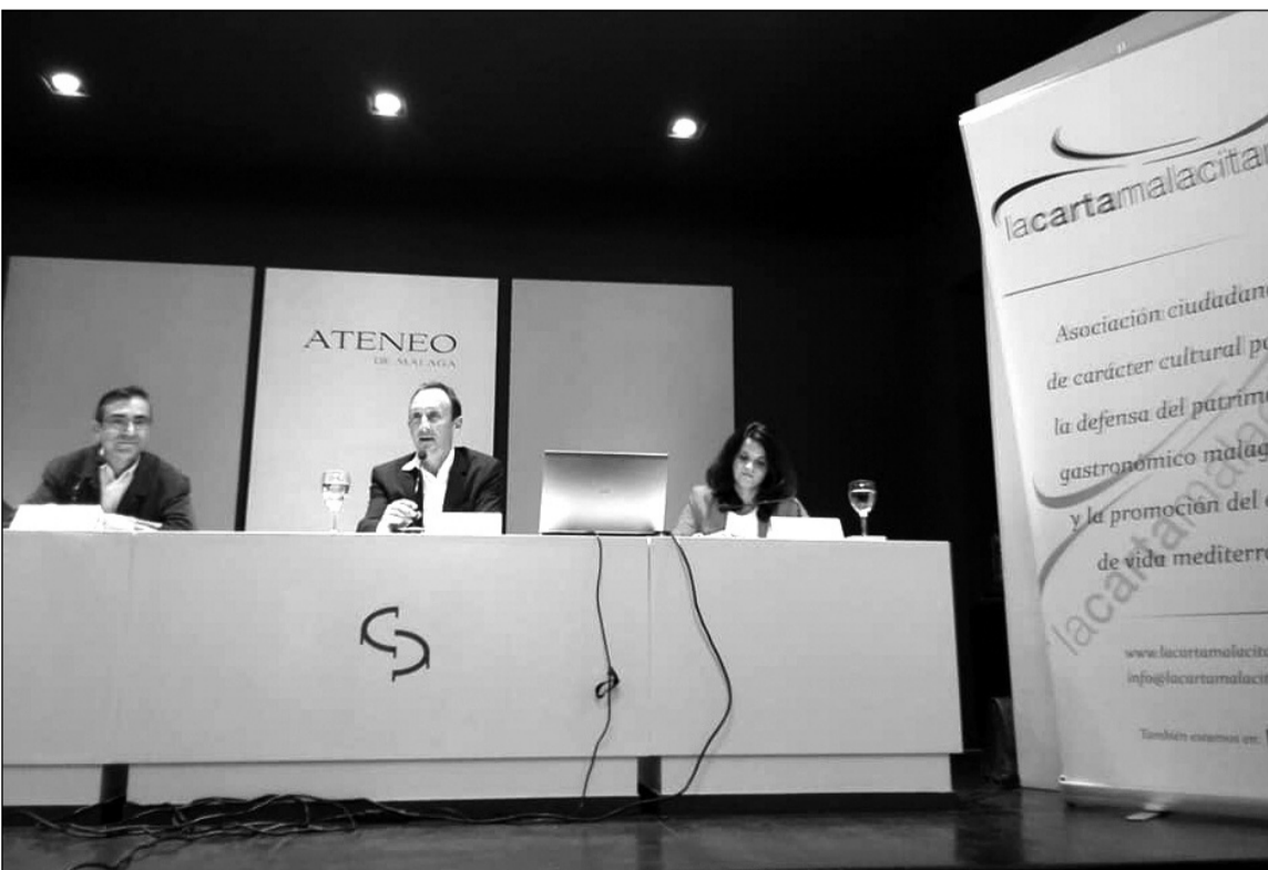
Un instante de la conferencia.