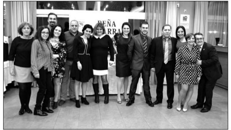
Los socios disfrutaron del aniversario.