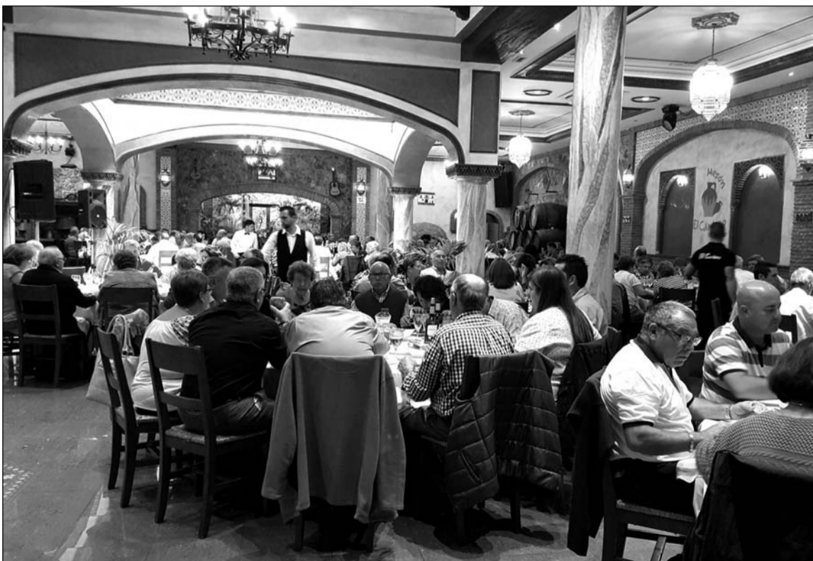
Comida de hermandad en el restaurante El Cántaro.