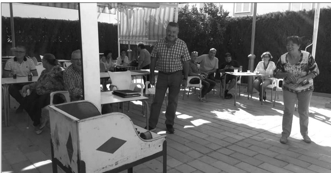
Una jugadora realiza un lanzamiento.

Aprovechando el buen tiempo, esta actividad se celebró al aire libre, constituyendo un gran éxito para esta entidad perteneciente a la Federación Malagueña de Peñas, Centros Culturales y Casas Regionales 'La Alcazaba'.