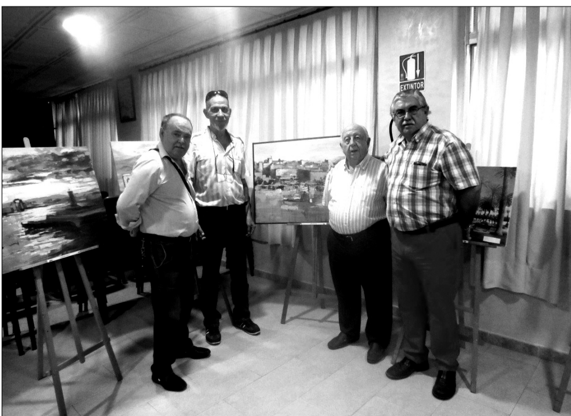
Jurado del certamen pictórico con la obra ganadora.