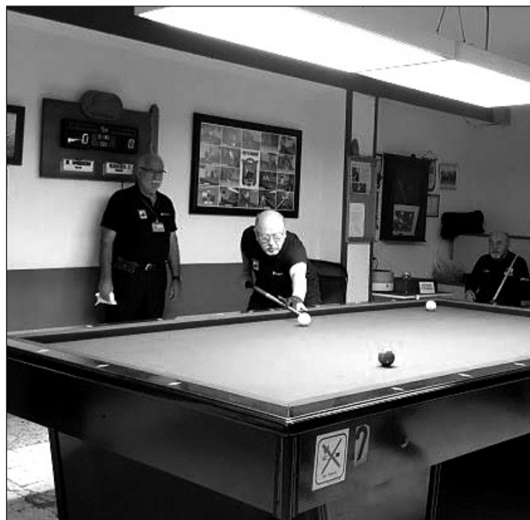
Imagen de una de las partidas disputadas.