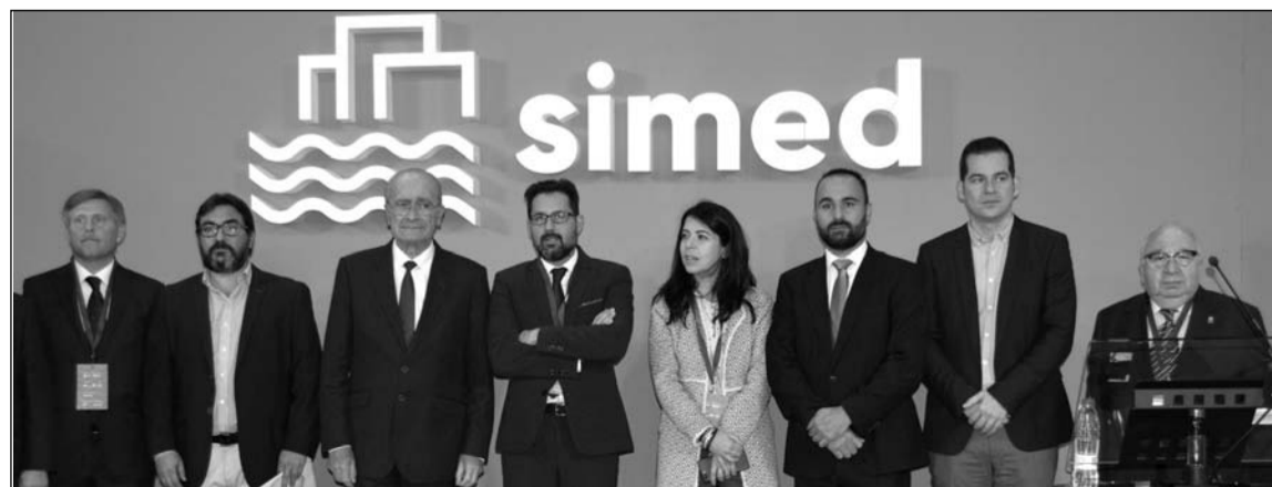
Acto de inauguración.

el Salón Inmobiliario del Mediterráneo, que se ha celebrado desde ese día al 12 de noviembre en el Palacio de Ferias y Congresos de Málaga.