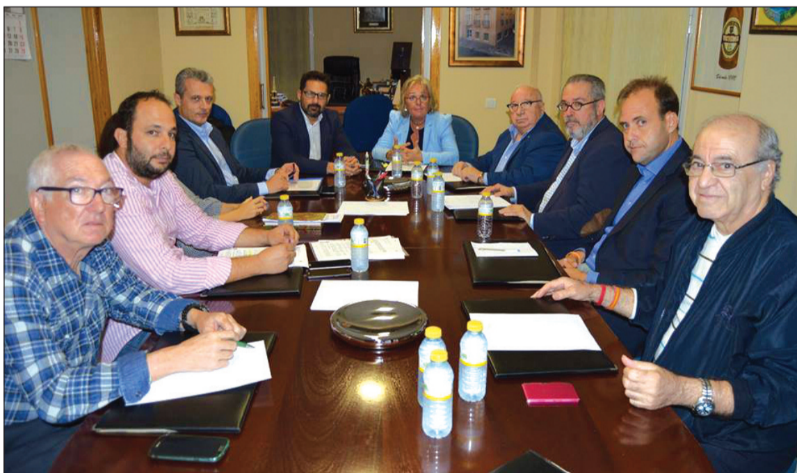
Reunión previa mantenida por representantes municipales y miembros de la Federación Malagueña de Peñas.