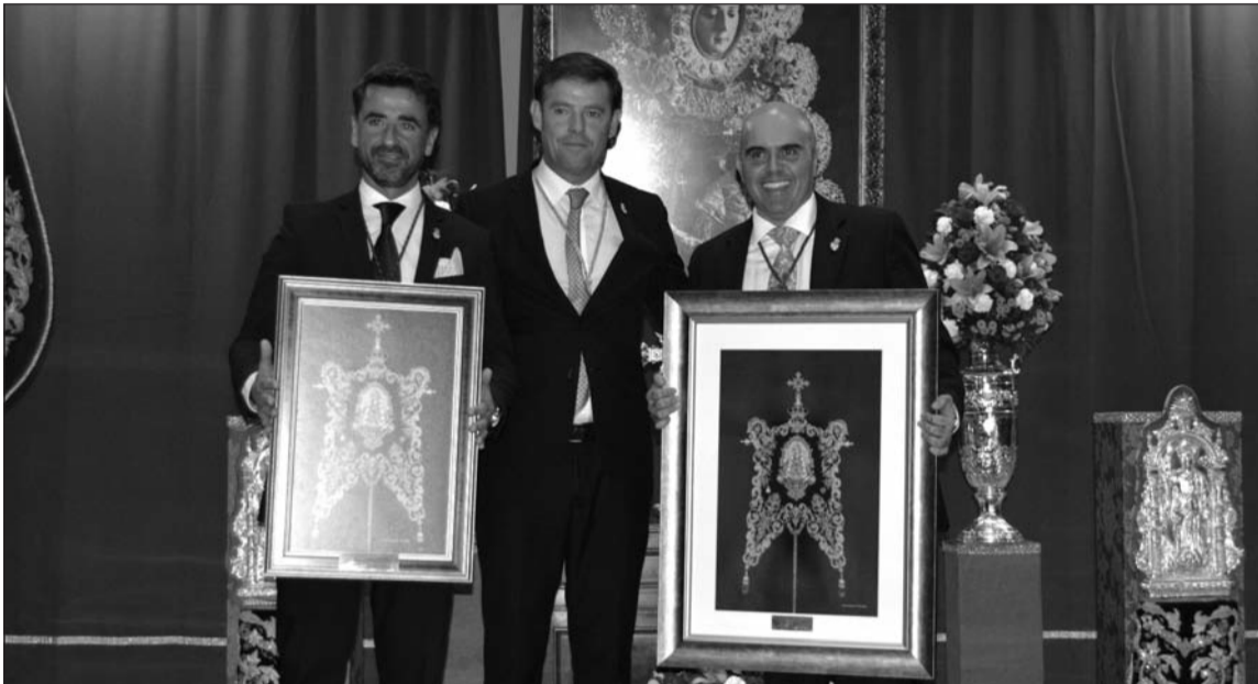
Entrega de recuerdos a los participantes en el acto.