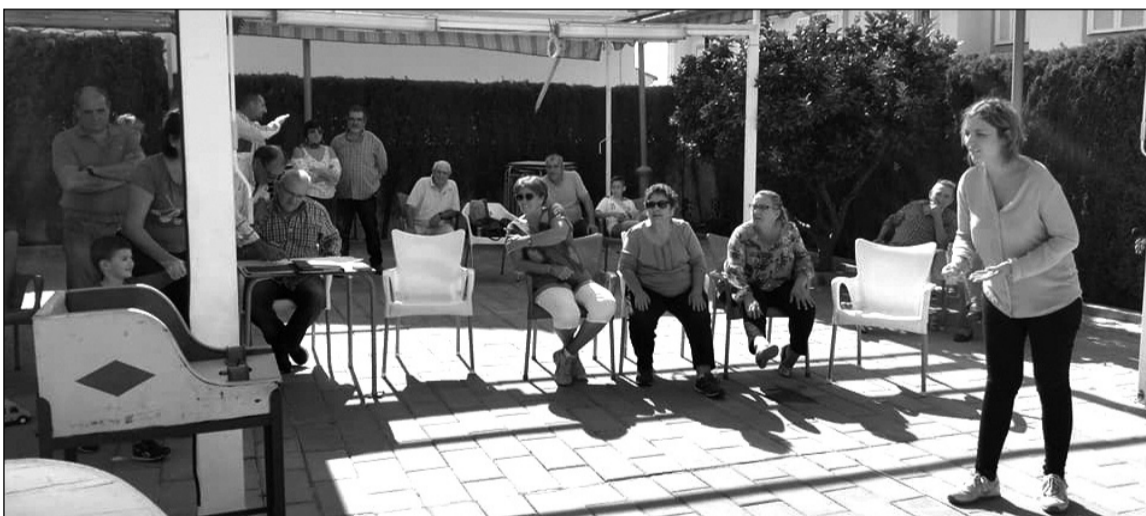
Se instalaron dos mesas en el exterior de la sede.