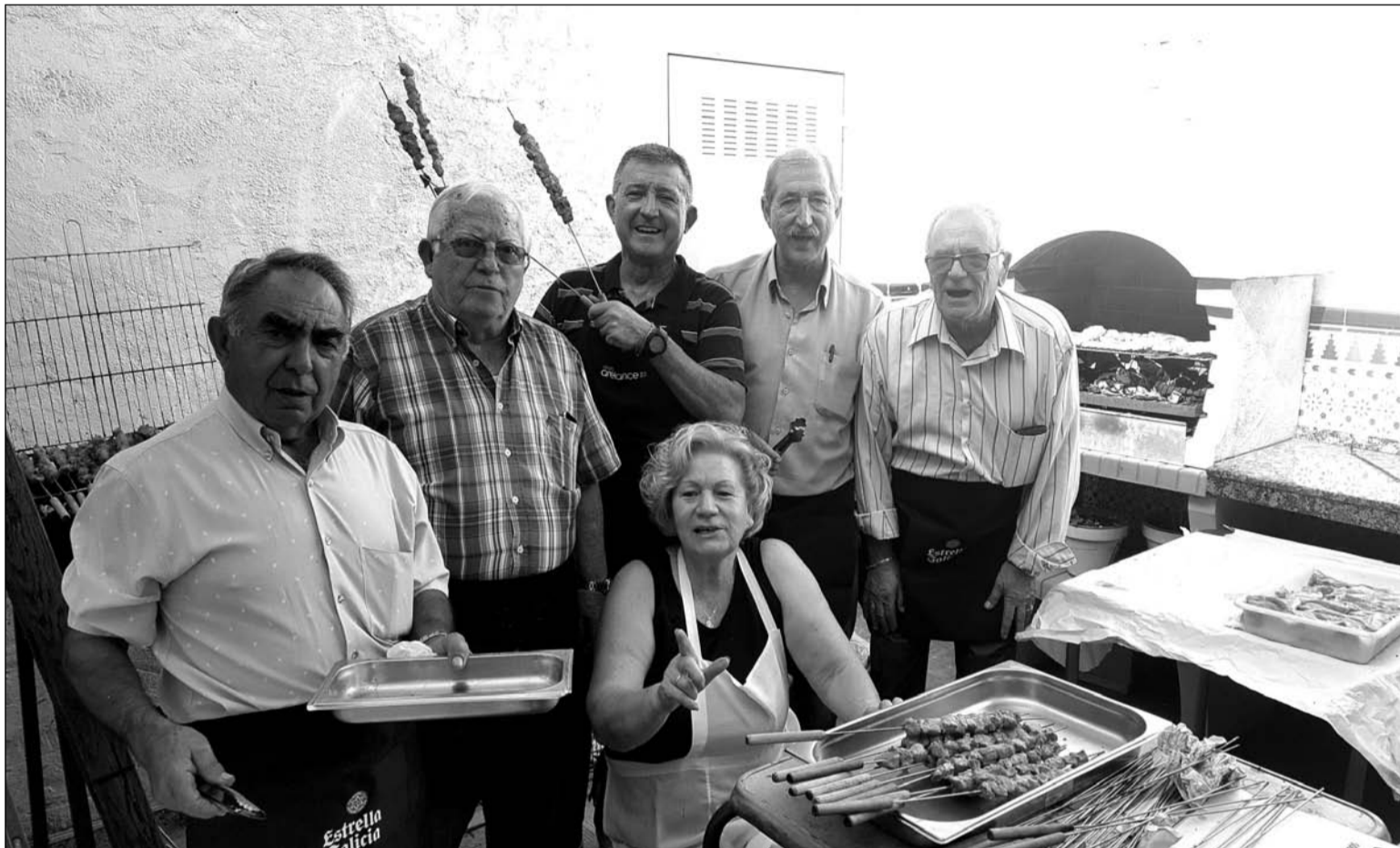
Socios de la entidad preparan la barbacoa.

No está mal para una jornada que no fue otoñal, pero si cumplió con su función gastronómica y de convivencia entre los socios.