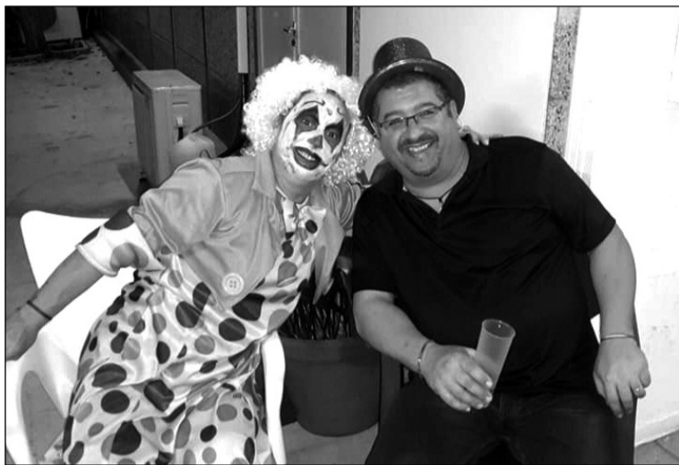
El presidente, con una payasa terrorífica.