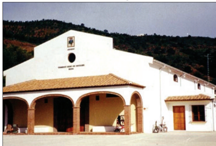
Bodega de Casa de Guardia, en la Finca Romerillo de Olías.

En fechas próximas se comunicarán nuevas excursiones a otros puntos de la provincia de Málaga para dar continuidad a este programa que tan buena aceptación está teniendo entre los peñistas.