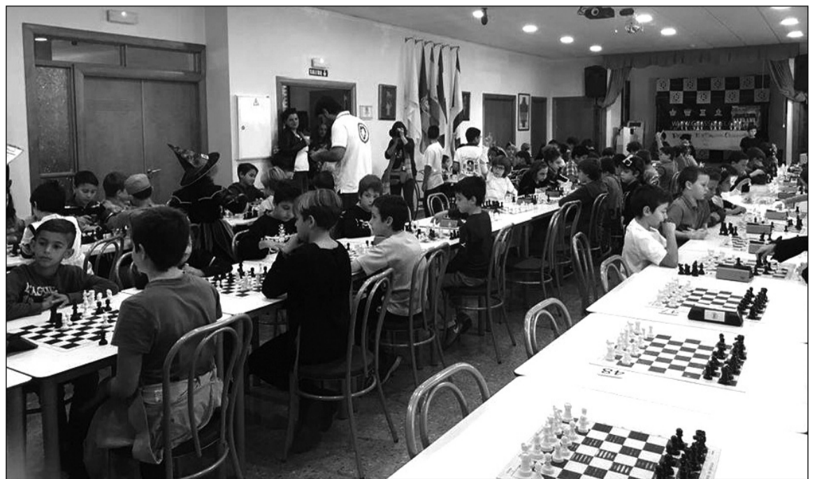
Torneo infantil de ajedrez celebrado en la sede.