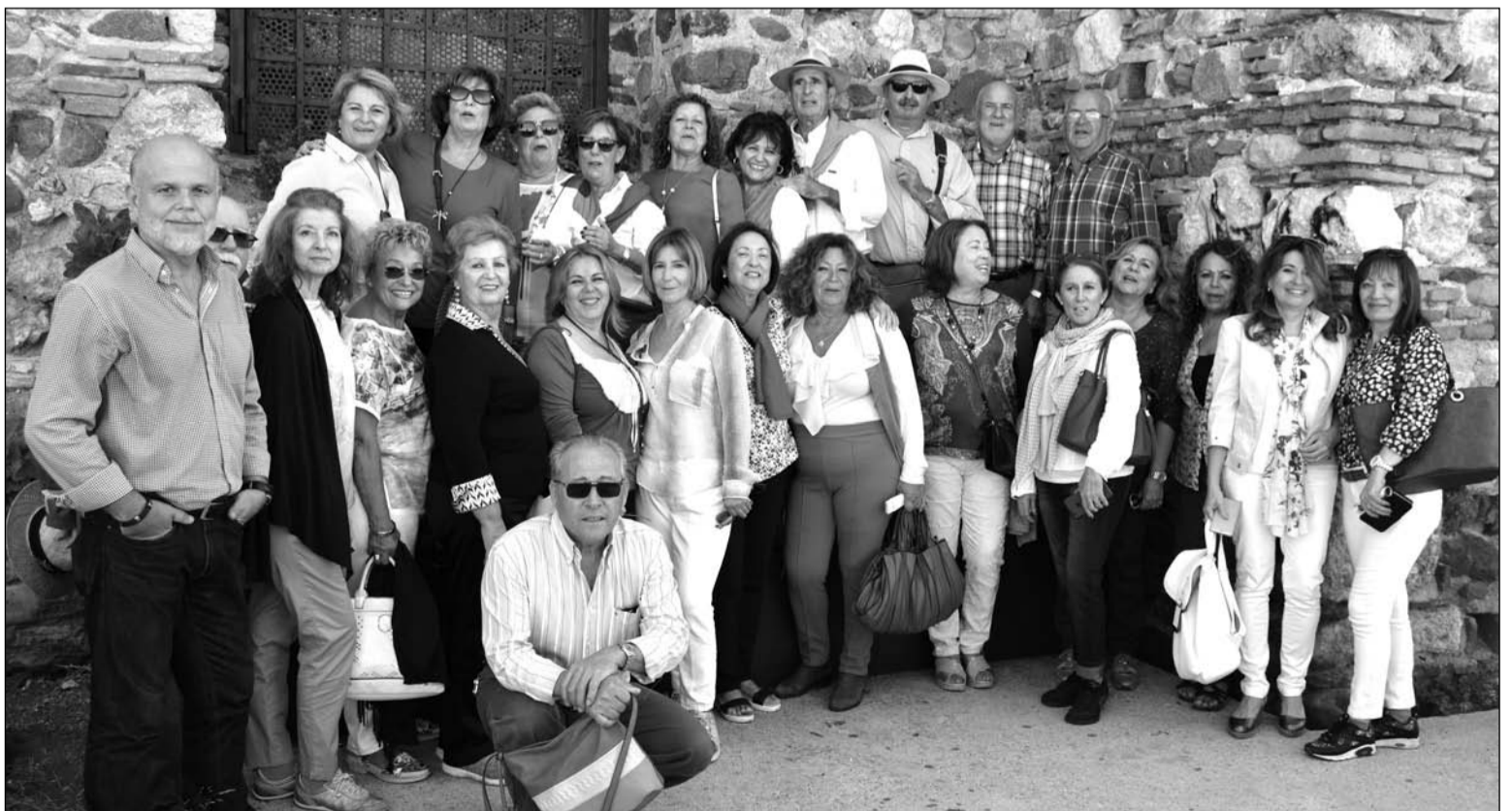
Imagen del grupo en las inmediaciones de la Alcazaba y el Teatro Romano.

Miembros de esta entidad perteneciente a la Federación Malagueña de Peñas, Centros Culturales y Casas Regionales 'La Alcazaba' aprovechaban una soleada jornada de sábado para conocer parte del legado de esta cultura que queda en nuestra ciudad, destacando la visita al nuevo mirador sobre el Teatro Romano en la Alcazaba.