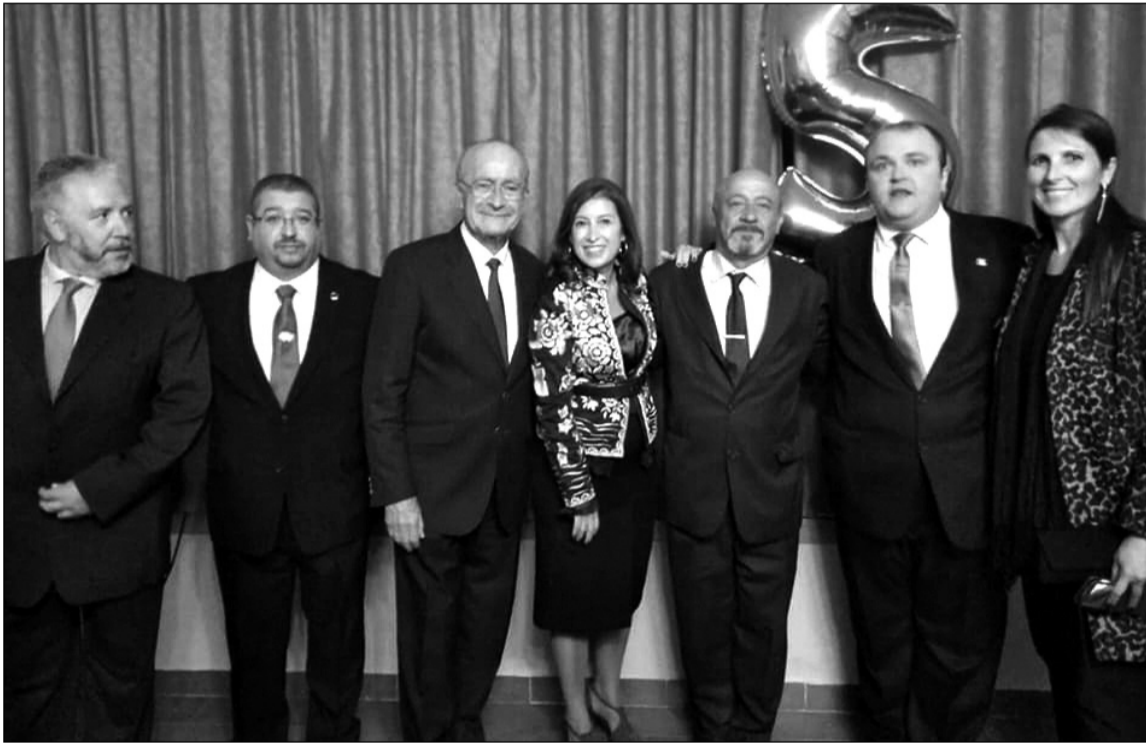
Autoridades municipales con representantes de distintas entidades participantes.