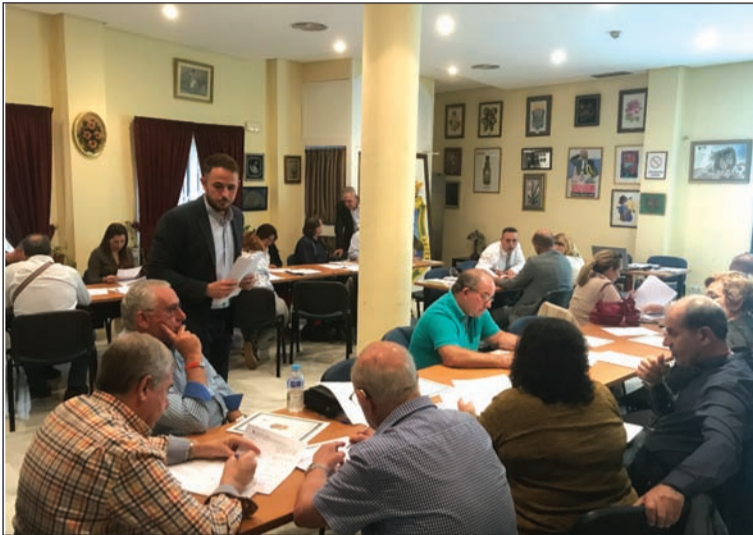
Curso de gestión de entidades.