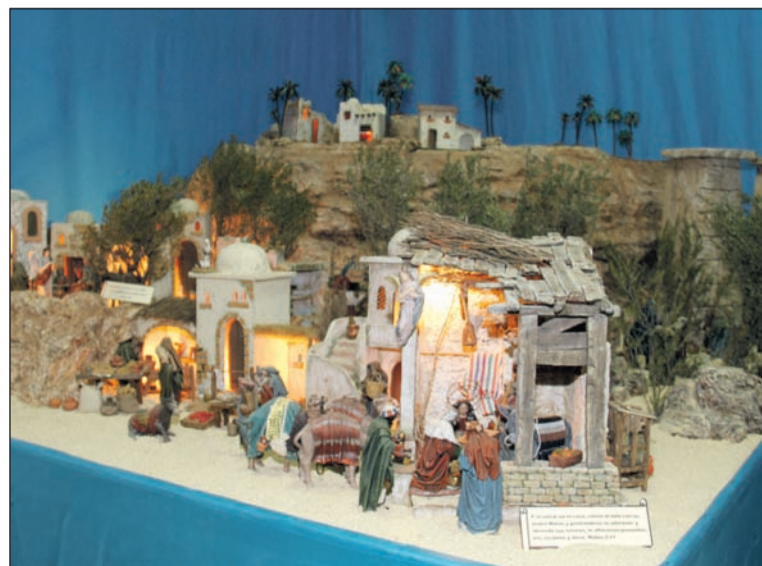
La Peña El Palustre obtuvo el primer premio del pasado año.