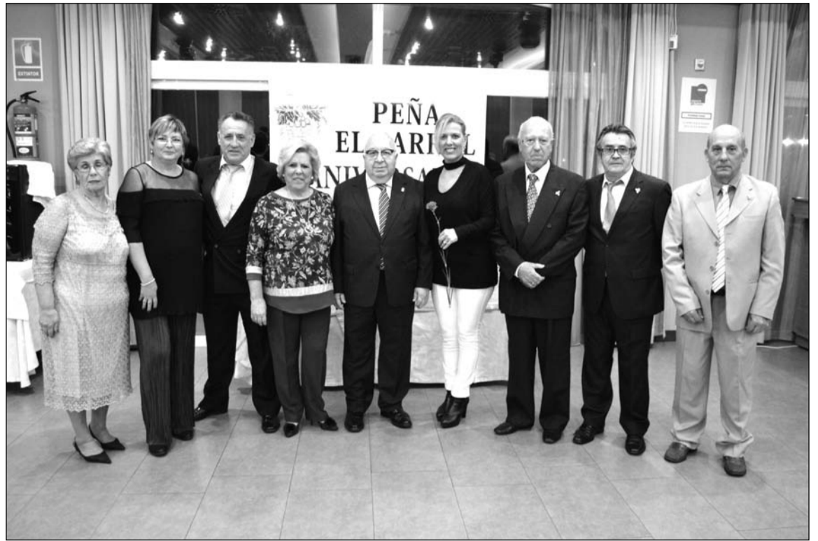
El presidente de la Federación con las homenajeadas y componentes de la entidad.

Entrando ya en fechas prenavideñas, el 3 de diciembre se celebrará a las 14 horas el XIII Encuentro de Pastorales José Muñoz Coalla en su sede; mientras que el miércoles 6 a las 18:30 horas se procederá a la inauguración del belén y se elaborarán borrachuelos.