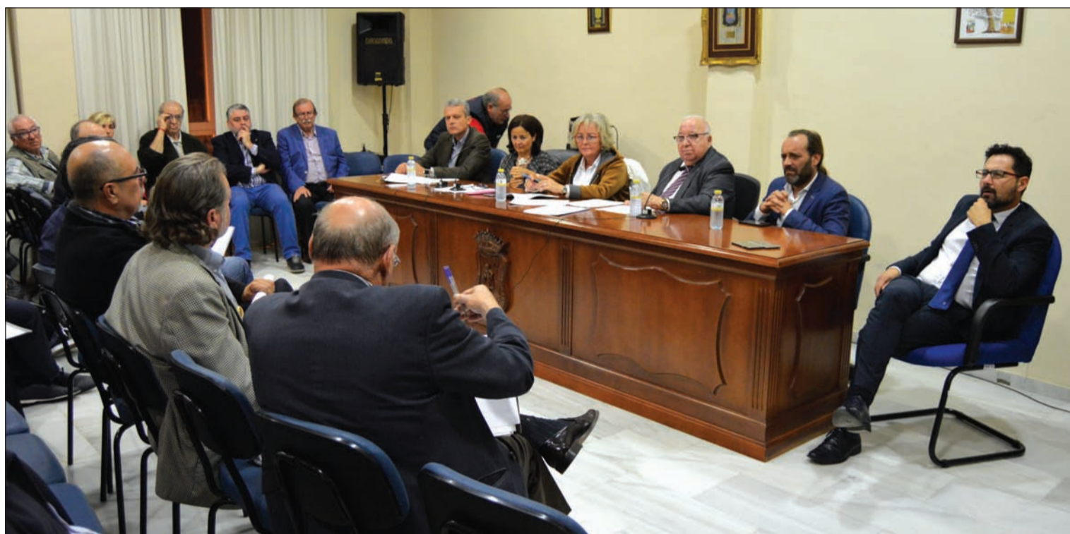
Imagen de la reunión mantenida el lunes en el salón de actos de la Federación Malagueña de Peñas.

Número 637 15 de Noviembre de 2017 C/ Pedro Molina, 1 Tfno: 952 22 54 39 Fax: 952 21 48 82 E-mail: prensa@femape.com - la_alcazaba@hotmail.com Web: www.femape.com Edición digital: www.femape.com/laalcazabadigital Twitter: @FMPLaAlcazaba Facebook: www.facebook.com/FMPLaAlcazaba