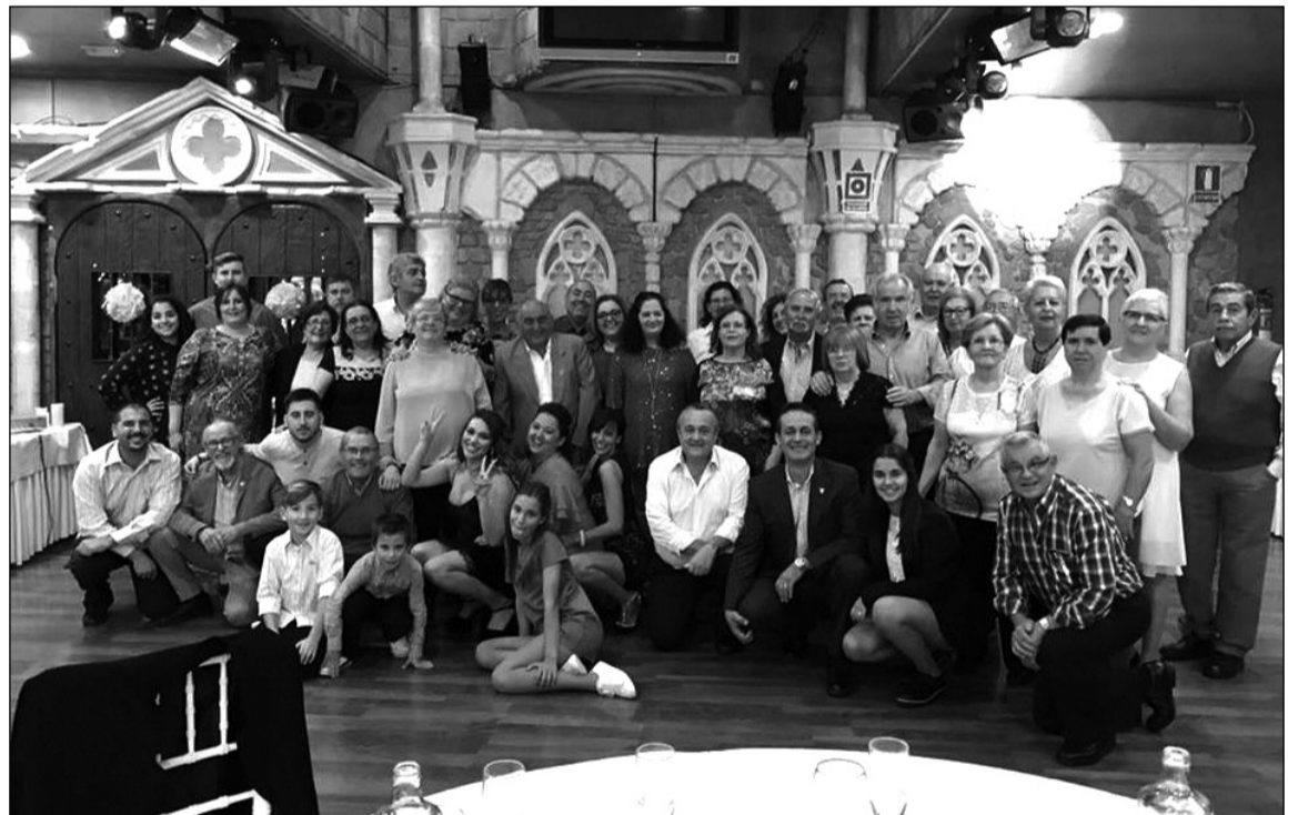
Imagen de grupo durante el homenaje a la presidenta saliente.