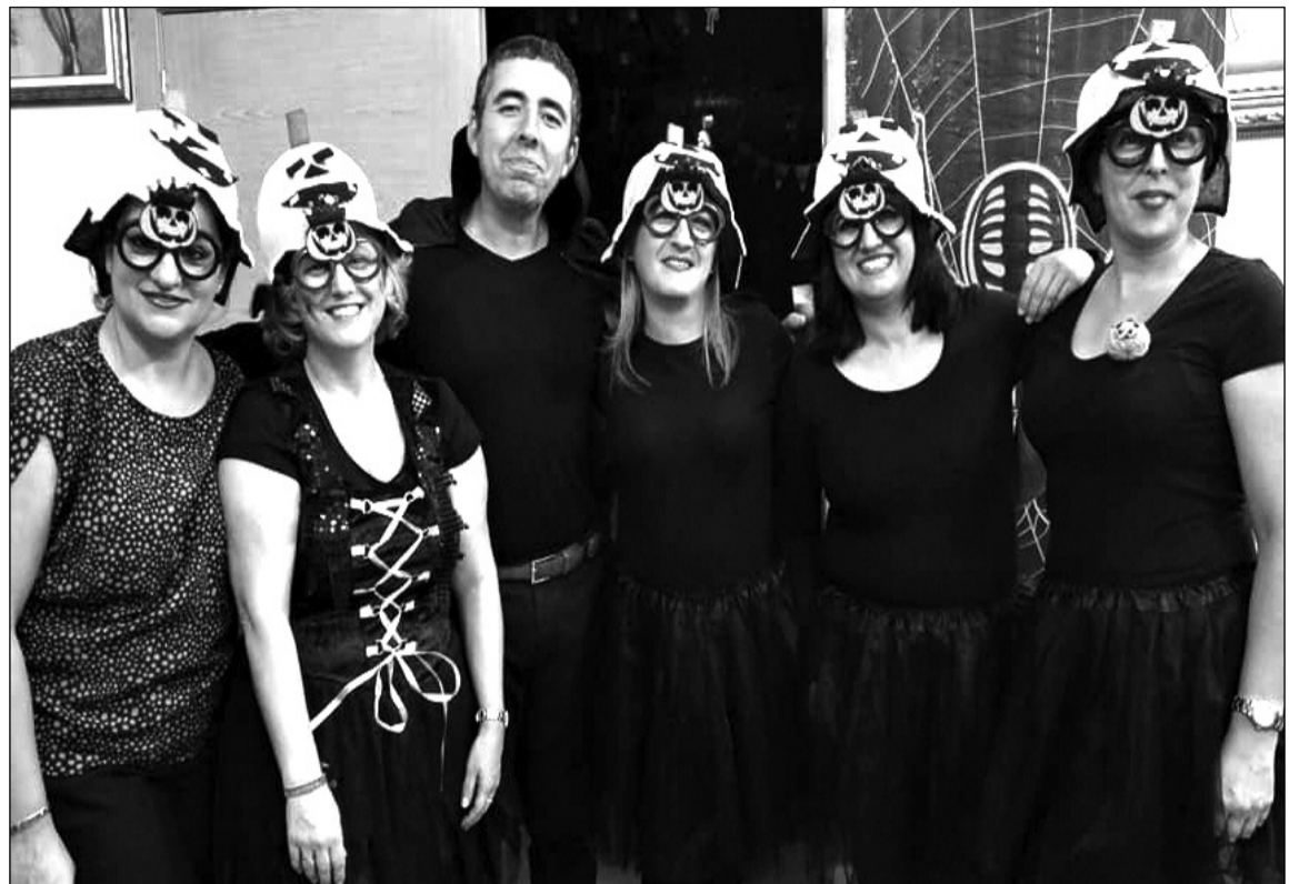
Grupo de jóvenes que acudieron disfrazados.