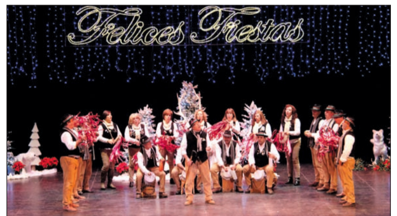
Una de las agrupaciones en el teatro Cervantes.

Desde la organización se recuerda que la Pastoral que no esté en el lugar y hora que se le asigne, no tendrá derecho a actuar en el Teatro Cervantes; así como recibir una ayuda de 100 euros por agrupación.