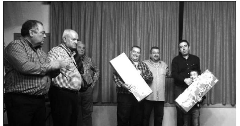
Entrega de premios del Interpeñas.

Próximamente, para el 25 de noviembre se organiza una Comida Cortijera que tendrá como plato principal una berza con su pringá.