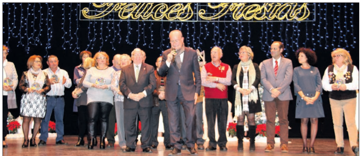
Acto de entrega de premios del pasado año en el Teatro Cervantes.

La organización se reserva el derecho de modificar cualquier punto, en interés de dicho concurso.