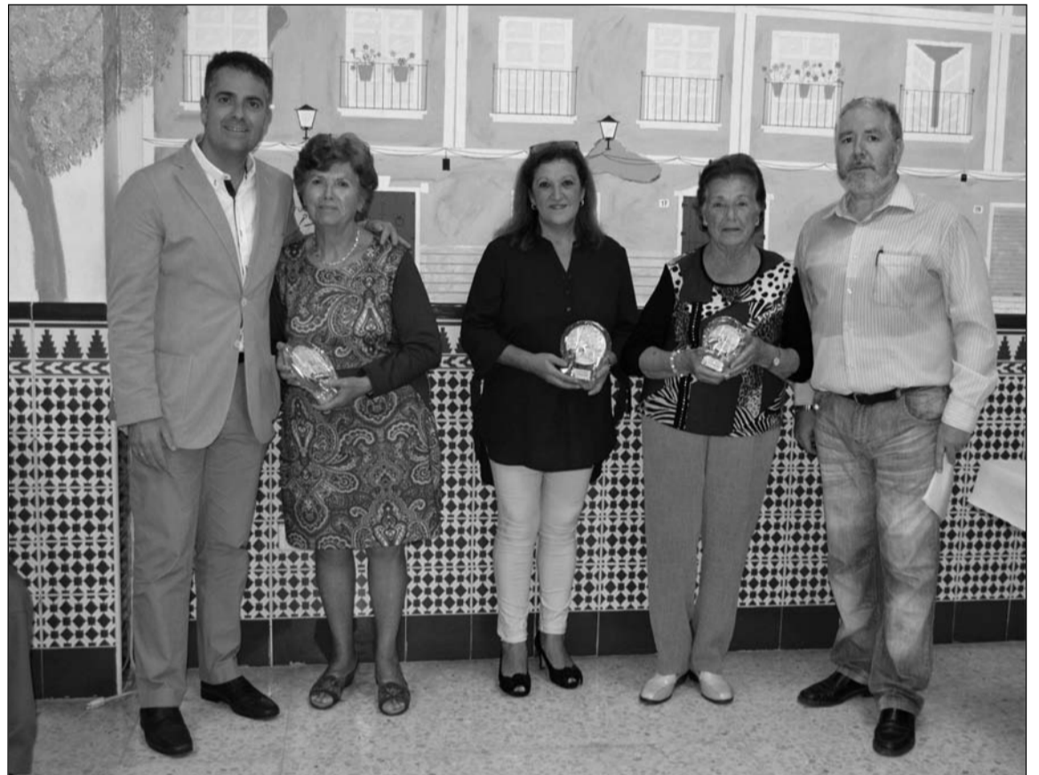
El concejal del distrito y el presidente, con las ganadoras del Concurso de Tortilla.