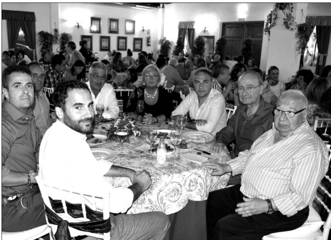
El presidente de la Diputación y el alcalde, junto a otras autoridades en la noche del sábado 12 en la caseta.