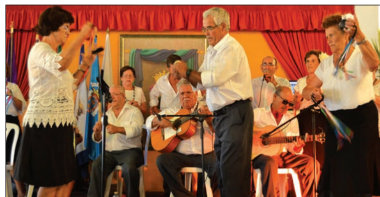
Grupo de Fandango Tarifeño.