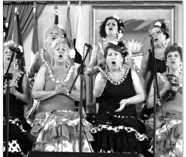
Integrantes del Coro Jazmines Malagueños.

Fue una magnífica ocasión para descubrir el arte que hay en las peñas malagueñas en plena Feria de nuestra capital.