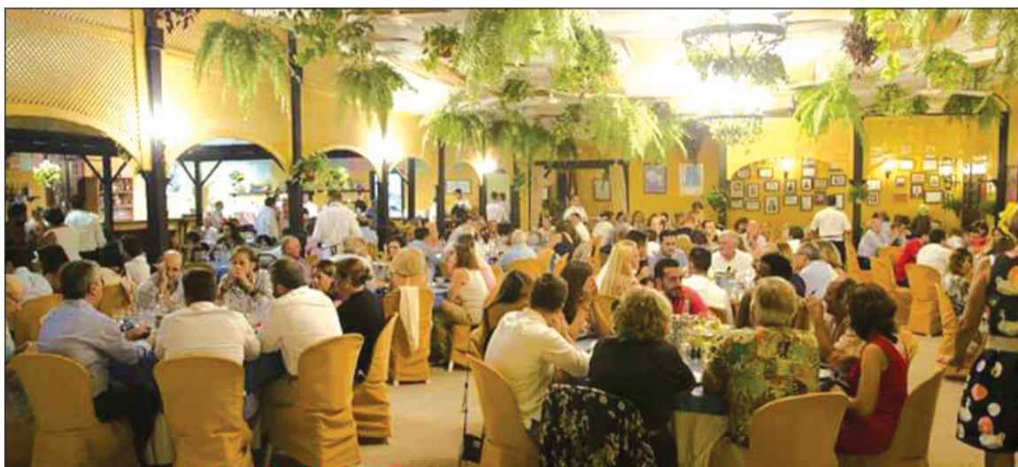
Aspecto que presentaba la Caseta de El Portón durante este acto.

los componentes de esta entidad, que desde hace años es una de las señas de identidad de la Feria de Málaga,