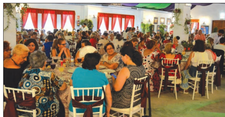
Aspecto que presentaba la caseta en el Día de la Mujer.