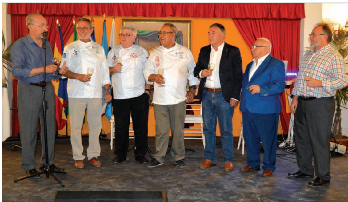
Brindis con aceite de oliva con el que concluía Comida por la Paz.