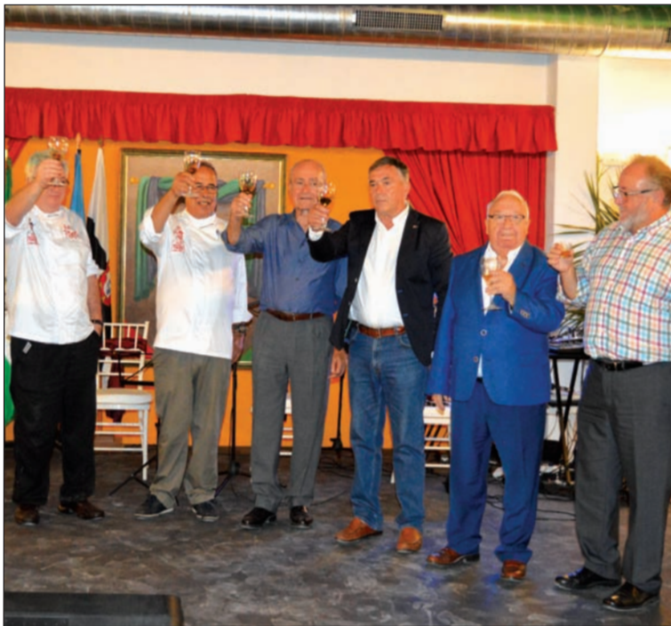
Brindis con aceite de oliva.