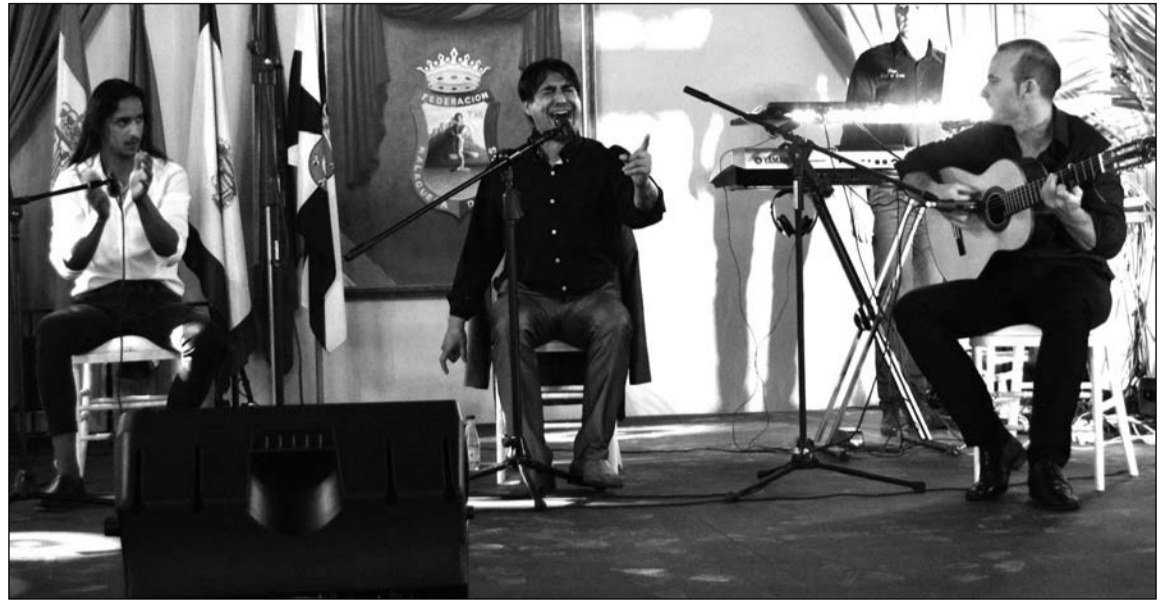
Actuación flamenco que cerró el Día de Ronda.

En los siguientes días se realizarían otros homenajes a los municipios de Antequera, Villanueva de Algaidas y Archidona.