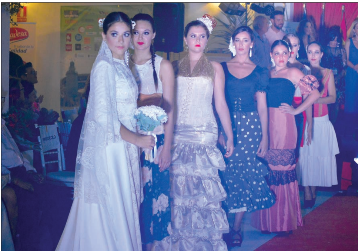
El desfile se cerró con un traje de novia.