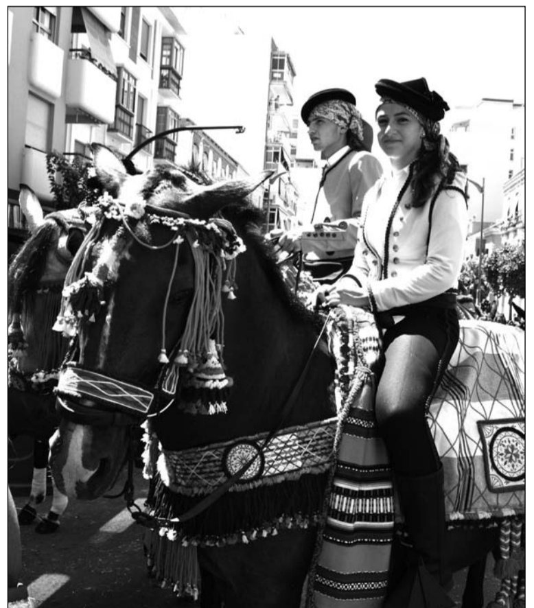
Caballistas de Ronda Romántica, invitados por la Federación de Peñas.