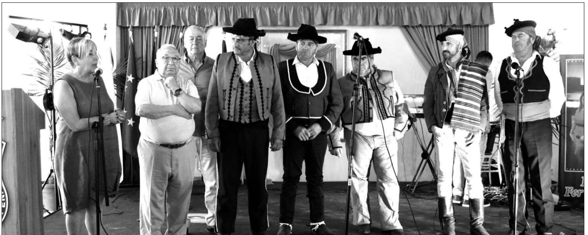
Acto de agradecimiento a los componentes de Ronda Romántica en la caseta de la Federación de Peñas.