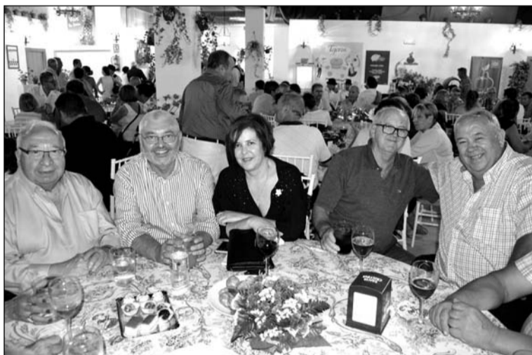
Visita de representantes de Peña La Florida y la Peña La Asunción.