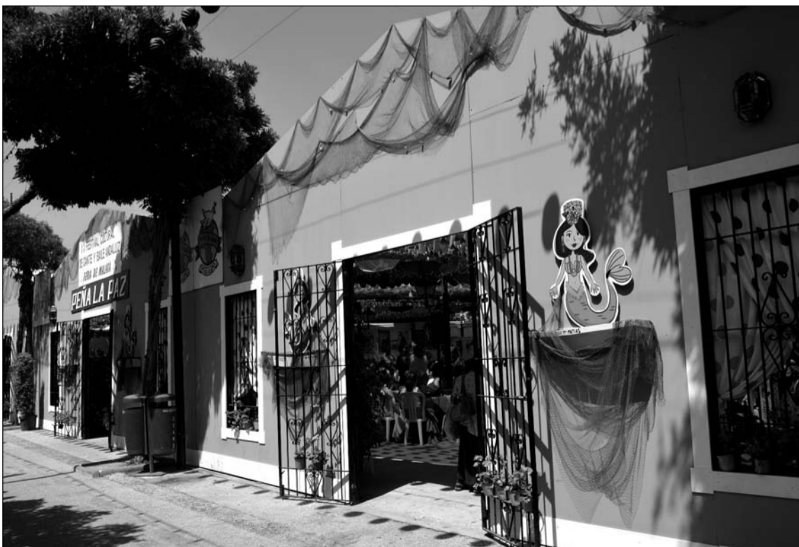
Fachada de la caseta de la Peña La Paz en esta feria de 2017.