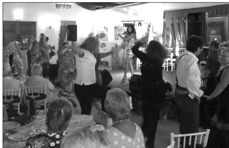
Una de las actuaciones, con el público bailando.