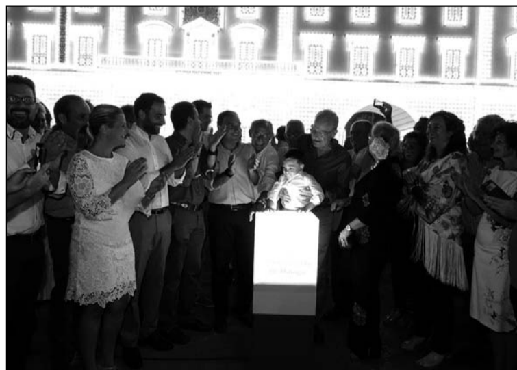
Encendido del alumbrado.