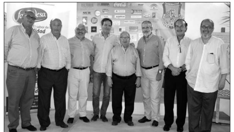
Visita de la Agrupación de Cofradías.