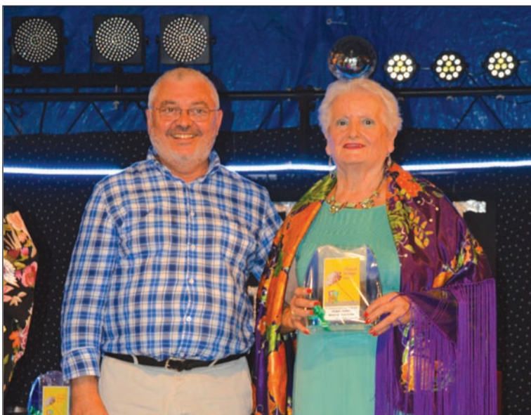
Primer premio de mantones pintados.