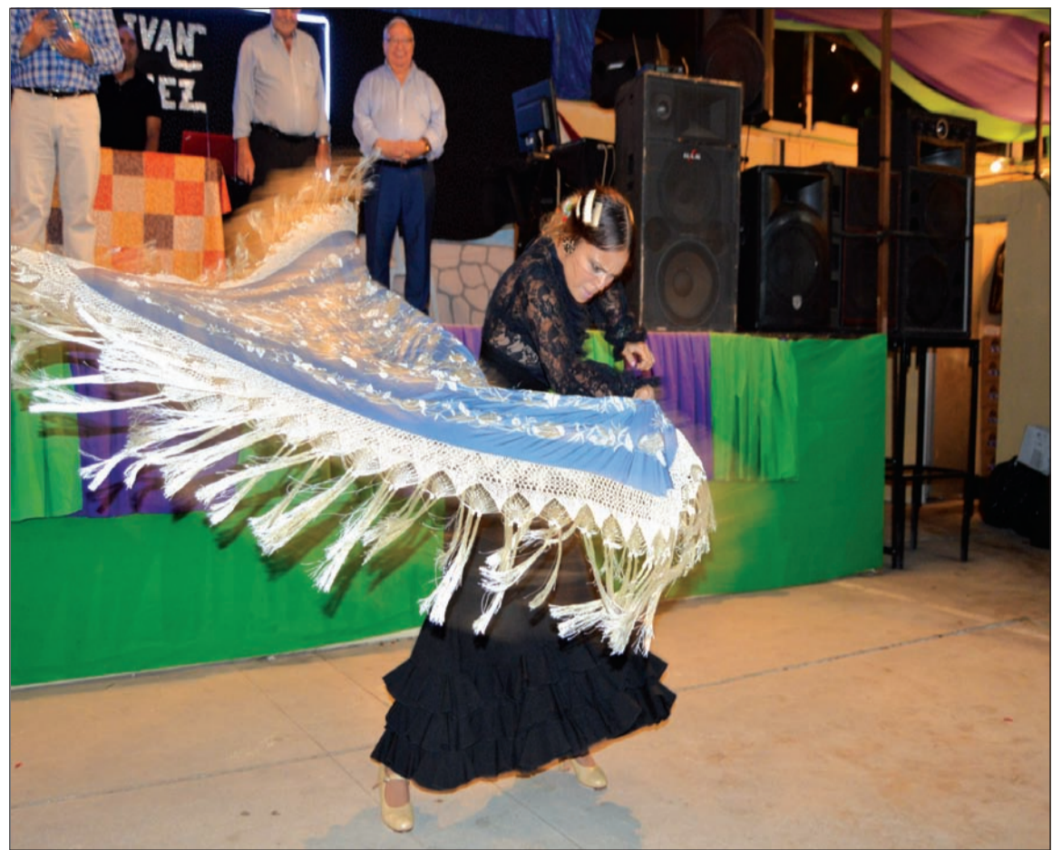
Ganadora del primer premio en la categoría de lucimiento.