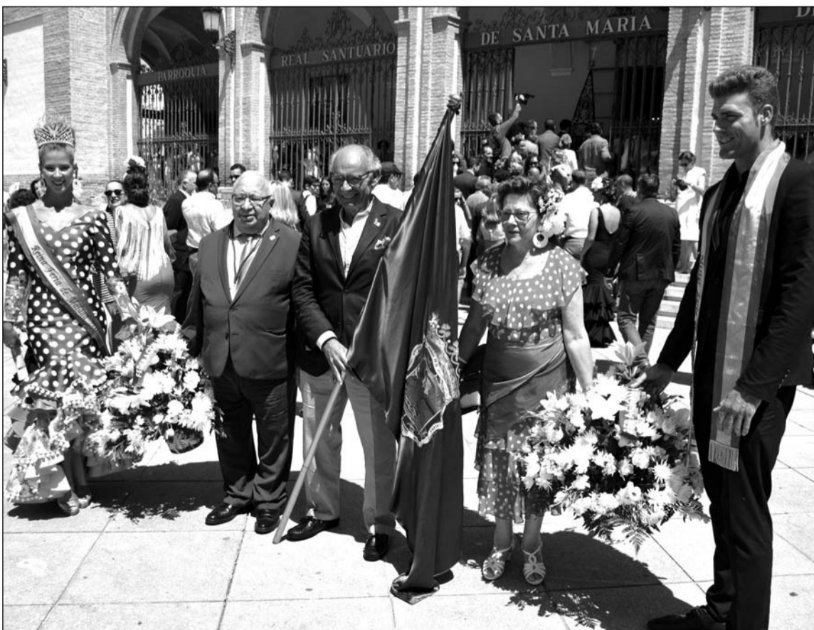
Representación de la Federación, con el abanderado, antes de realizar la ofrenda a la Patrona.