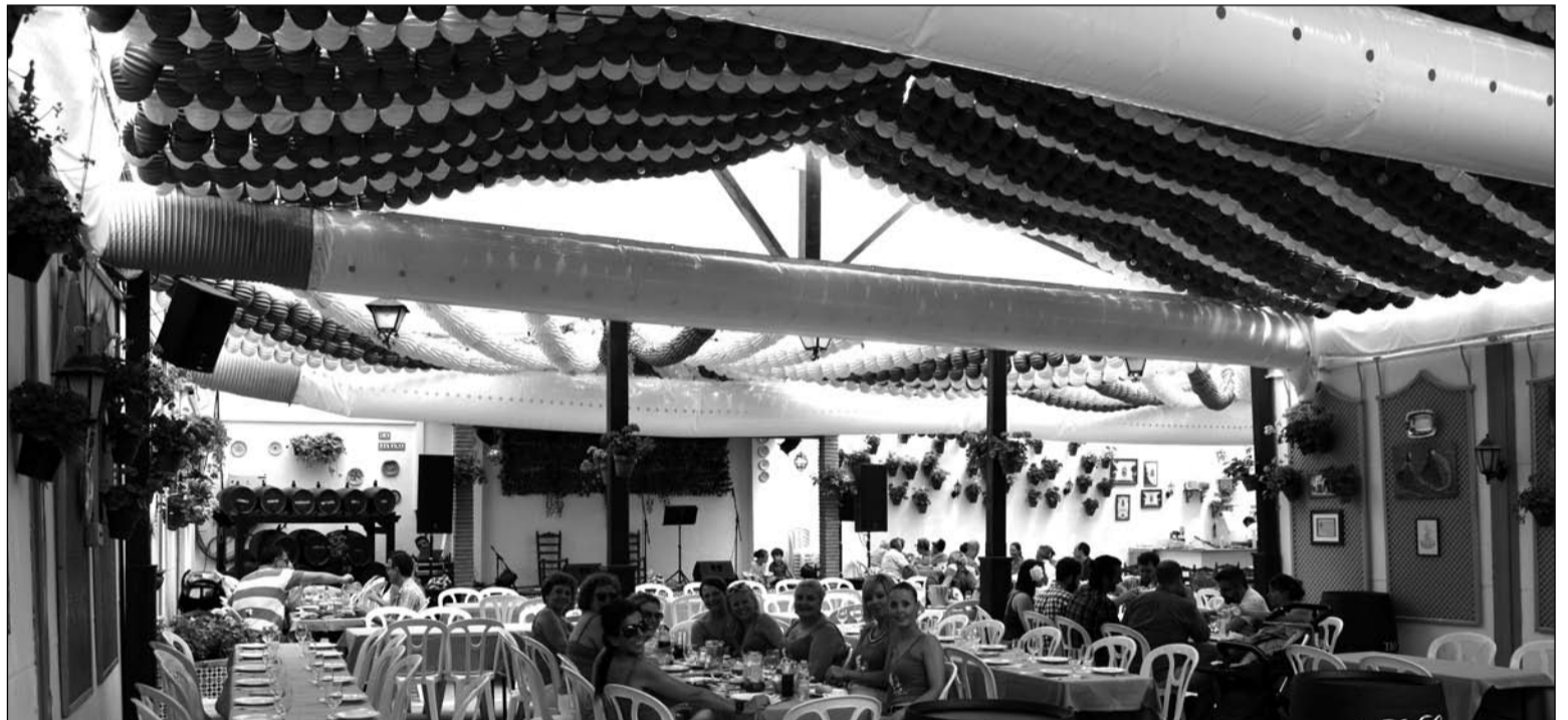
Interior de la caseta de La Jarana, primer premio de este año.