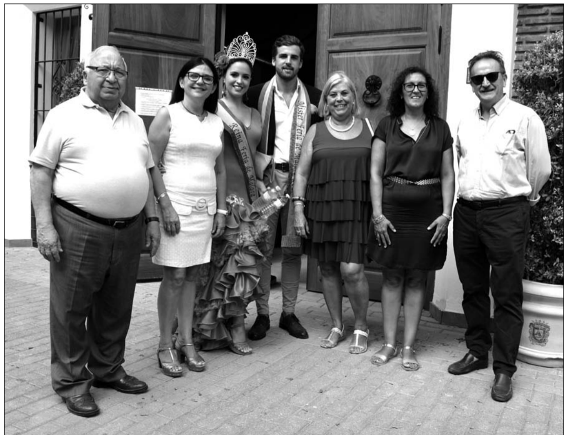
Representación institucional llegada desde Archidona, con el presidente de la Federación y la Reina y el Mister.