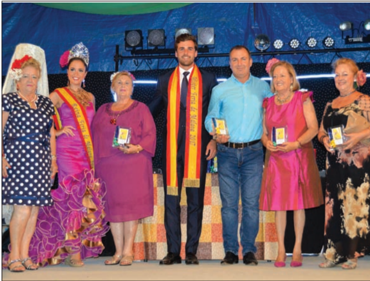
Recuerdos a los miembros del jurado, entregados por la Reina y el Mister.