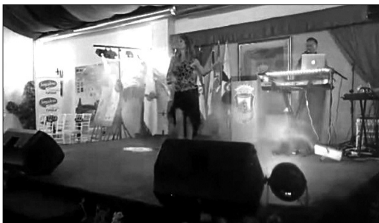
Una de las actuaciones del dúo en el escenario de la caseta.