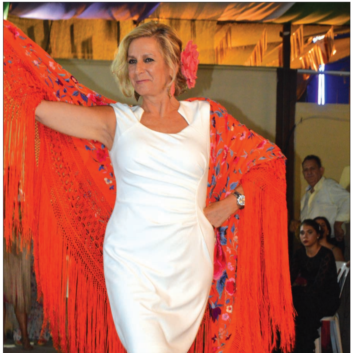
Primer premio en la categoría de mantones bordados.

bros de la Asociación Pro Tradiciones Malagueñas 'La Coracha', institución que se ha destacado por la reivindicación del uso de esta prenda.