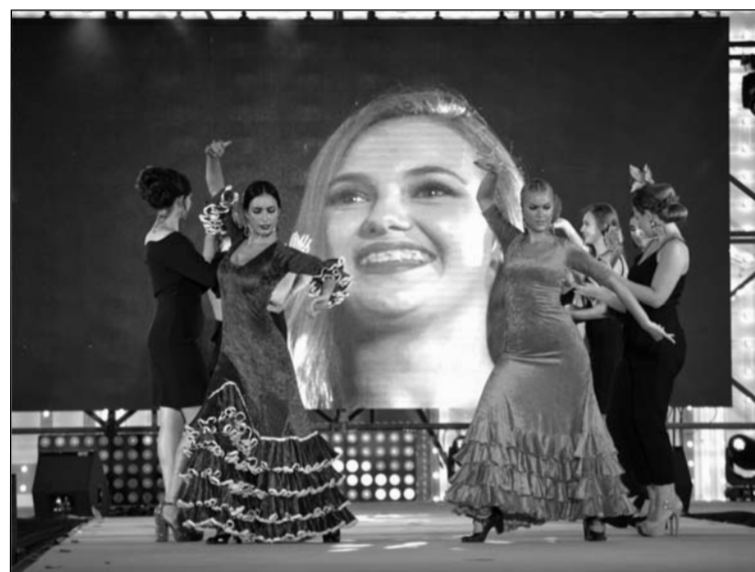
Se ofrecieron bailes de diferentes culturas durante los pases.