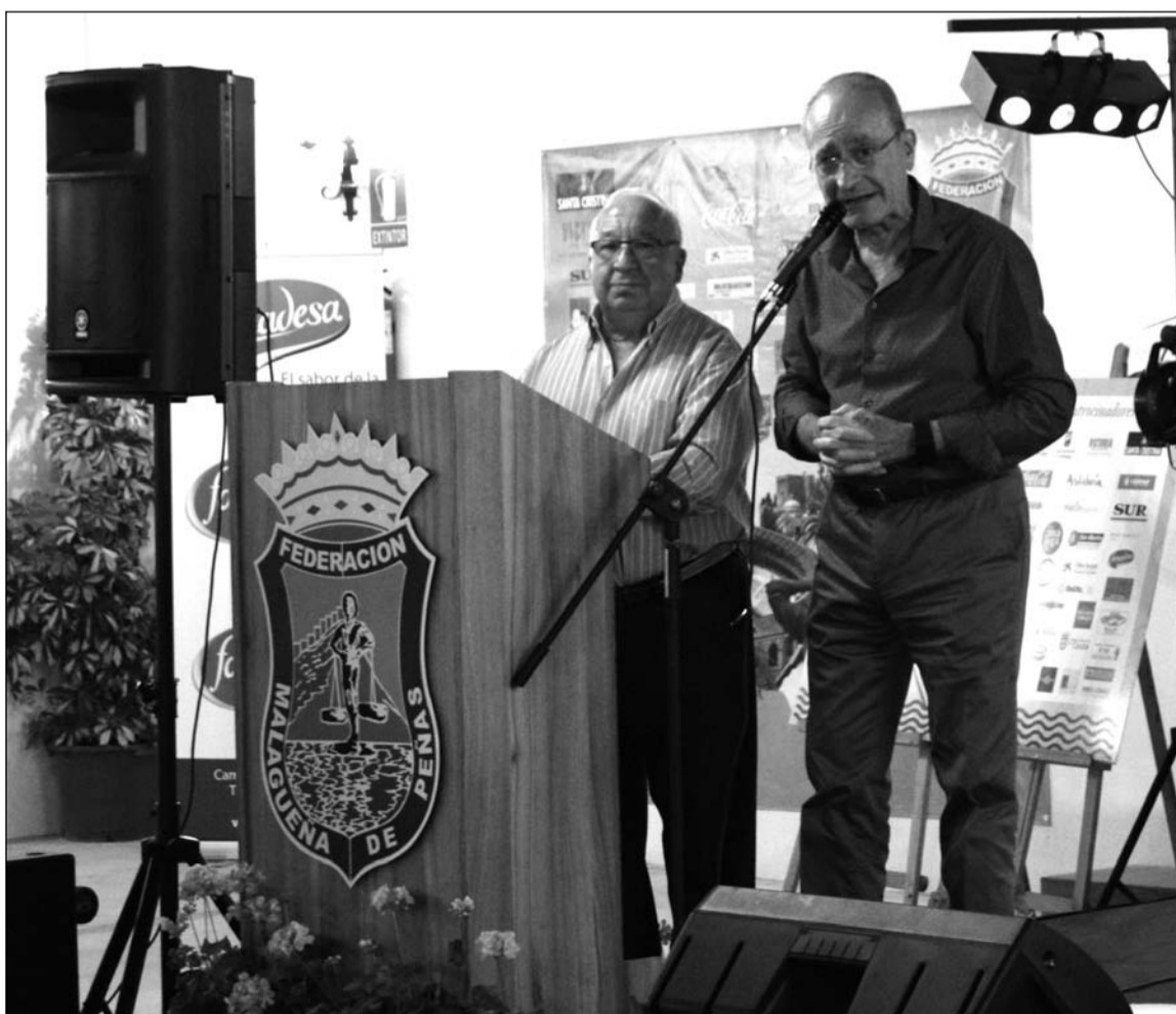
Intervención del alcalde, Francisco de la Torre, en presencia del presidente de la Federación, Miguel Carmona.