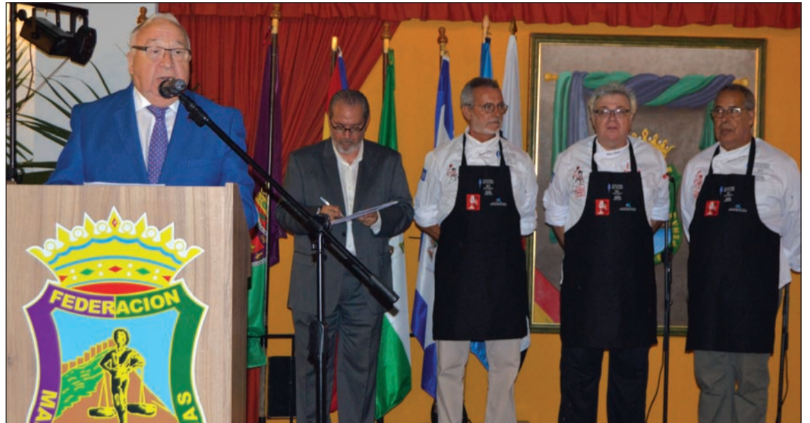
Intervención del presidente al inicio de la cena.