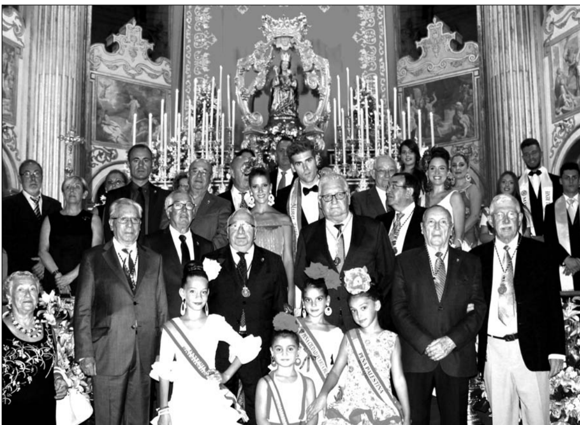
Imagen de archivo de la ofrenda del pasado año.

Como es habitual, serán recibidos por representantes de esta hermandad. Estos representantes de la belleza malagueña se reencontrarán con la patrona en su día grande, el mismo 8 de septiembre, al participar en la Solemne Procesión de Santa María de la Victoria en su onomástica. En este caso será la Reina y el Mister, con sus cinco Damas y Caballeros de Honor, los que participen en este cortejo acompañando a componentes de la junta directiva de la Federación.