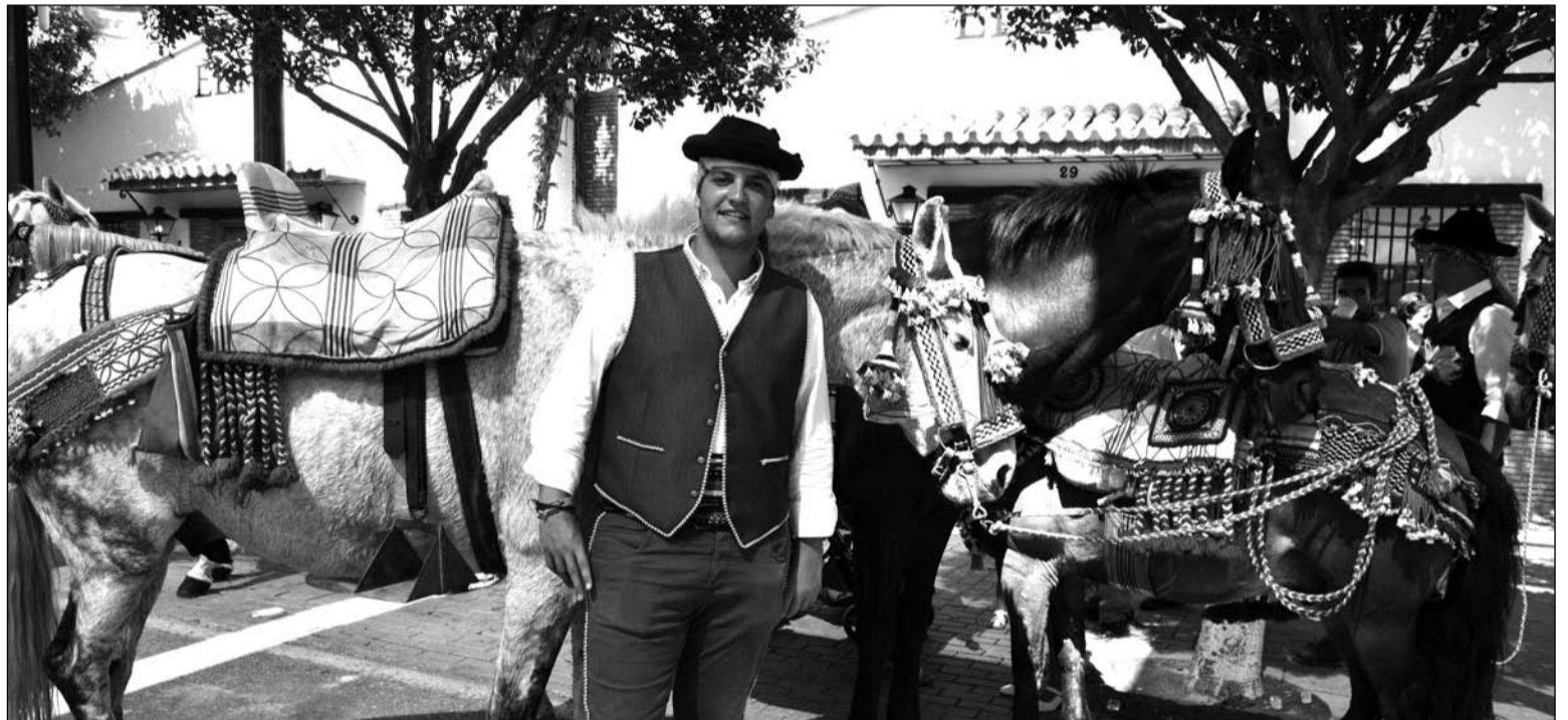
Uno de los caballistas desplazados de Ronda, ante algunos de los equinos.