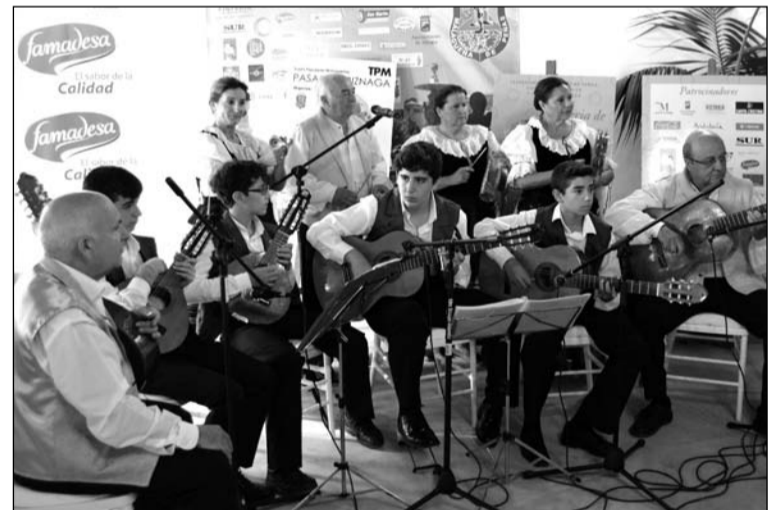
Muestra de folclore de Villanueva de Algaidas.