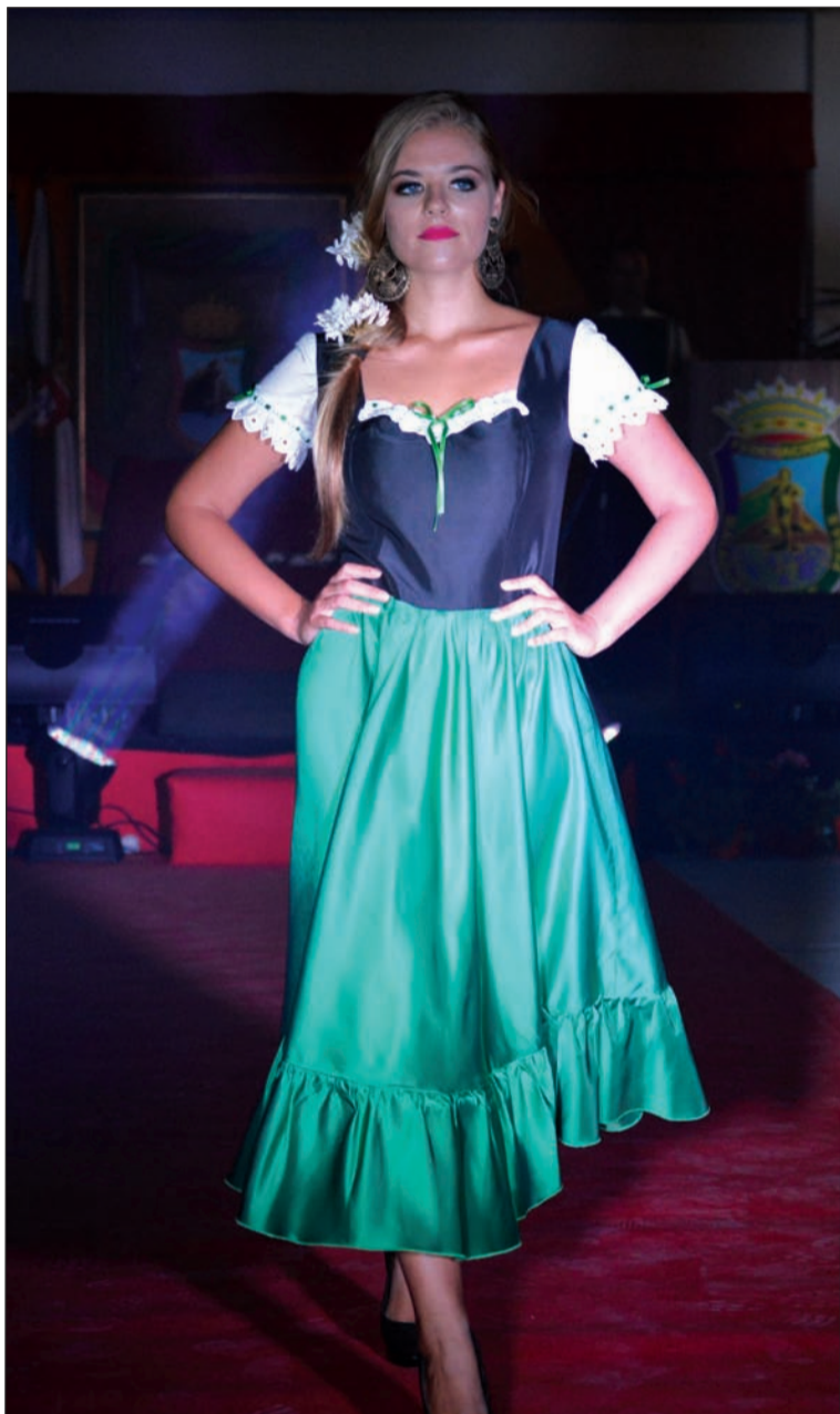
Una de las propuestas presentadas en la pasarela.

Casas Regionales 'La Alcazaba' ha contado con la colaboración de diferentes empresas de diversos sectores que han hecho posible este evento. Este es el caso de Rosapeula, DisOfic, Ribes&Casals, Kolp Group, Qeros o Strava.