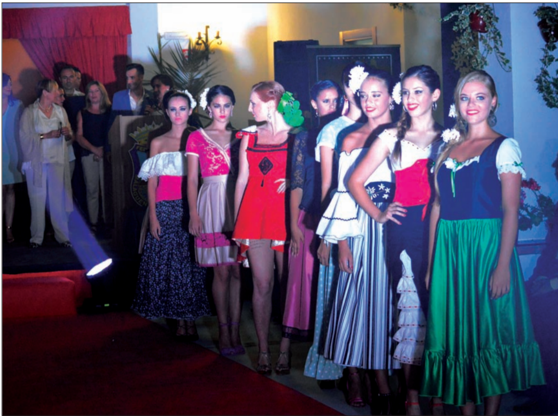
Modelos luciendo los trajes creados por los diseñadores.