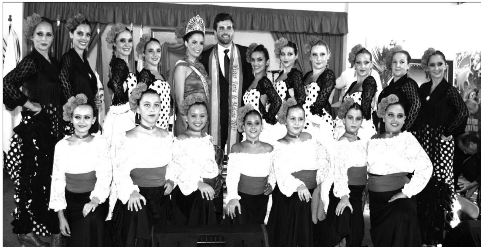
Componentes de Solera con la Reina y el Mister.