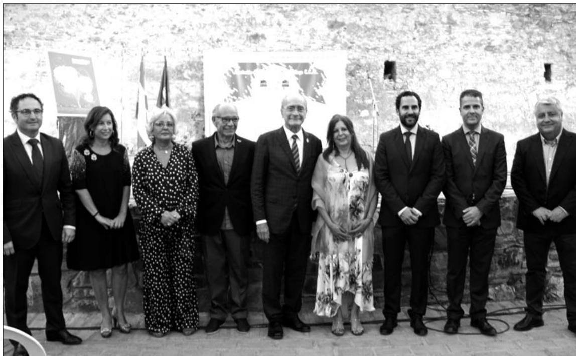
El nombramiento de abanderado tenía lugar en Gibralfaro.

El colectivo peñista también estará en la romería, como es habitual con la participación con un coche de caballos en el que irán la Reina y el Mister del pasado año; aportando además la presencia de caballistas de Ronda Romántica.