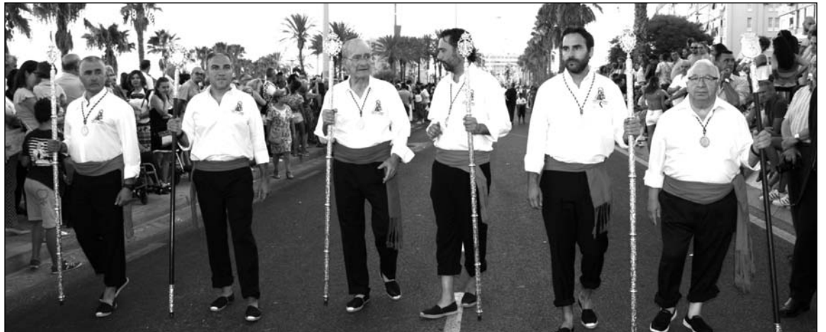
El presidente de la Federación de Peñas, a la derecha, con algunas de las autoridades asistentes.