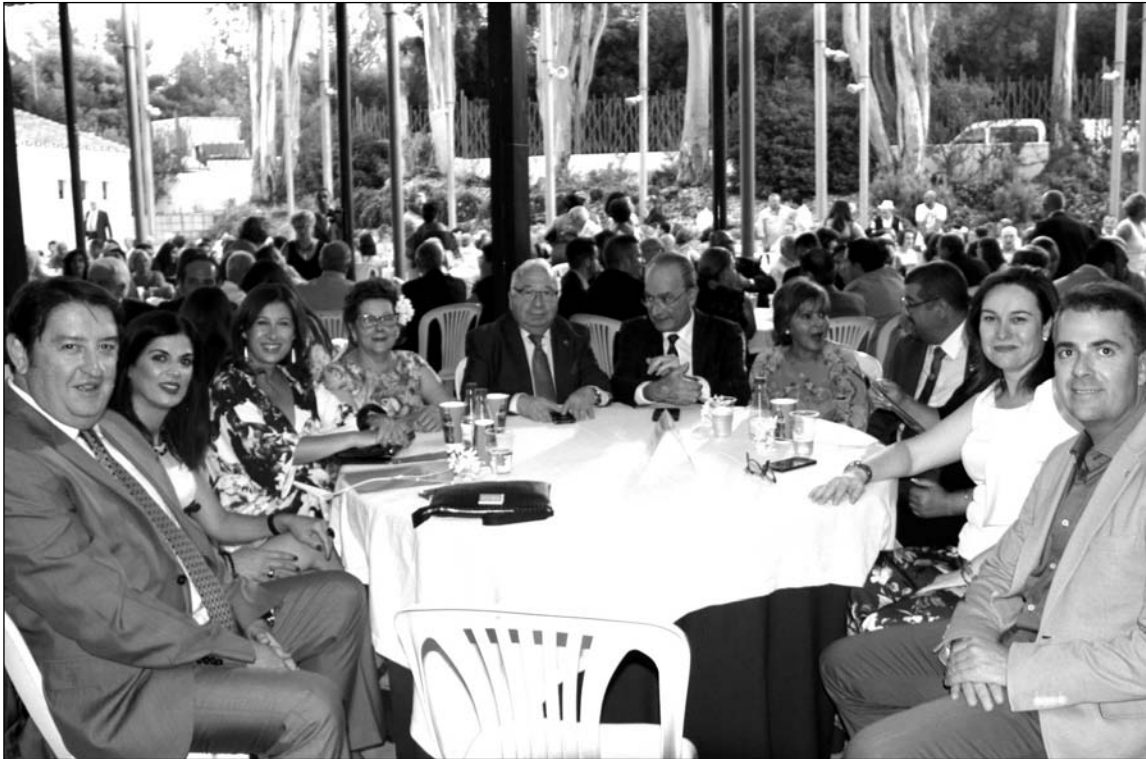
Mesa presidencial en la Fiesta de la Biznaga.