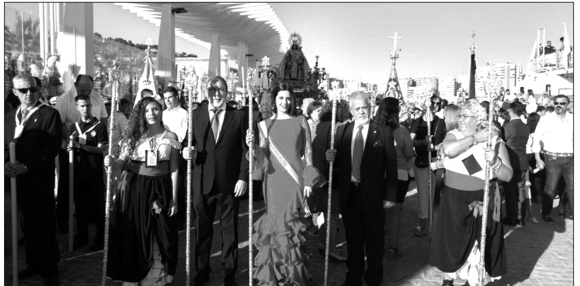
Componentes de la entidad ante la Virgen del Carmen.

En otro orden de cosas, la entidad era invitada a participar un año más en la procesión de la Virgen del Carmen Coronada; en un acontecimiento muy emotivo para todos los percheleros.