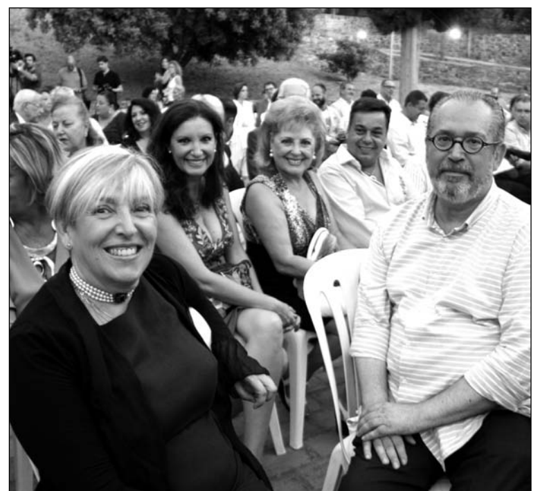
Representación peñista en el acto.