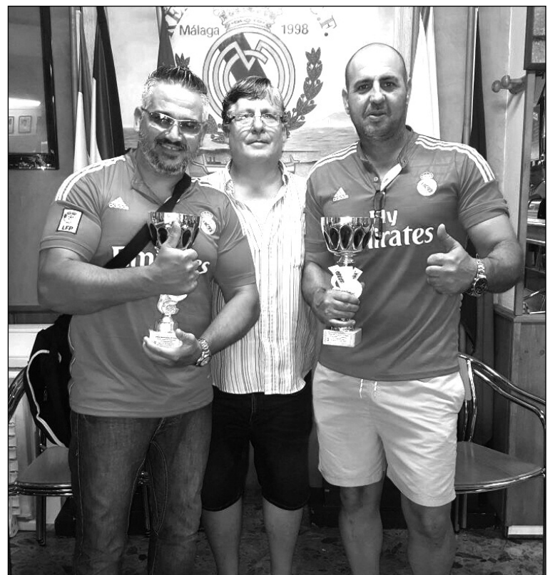
La entidad también ha celebrado un concurso de rana y subastao.