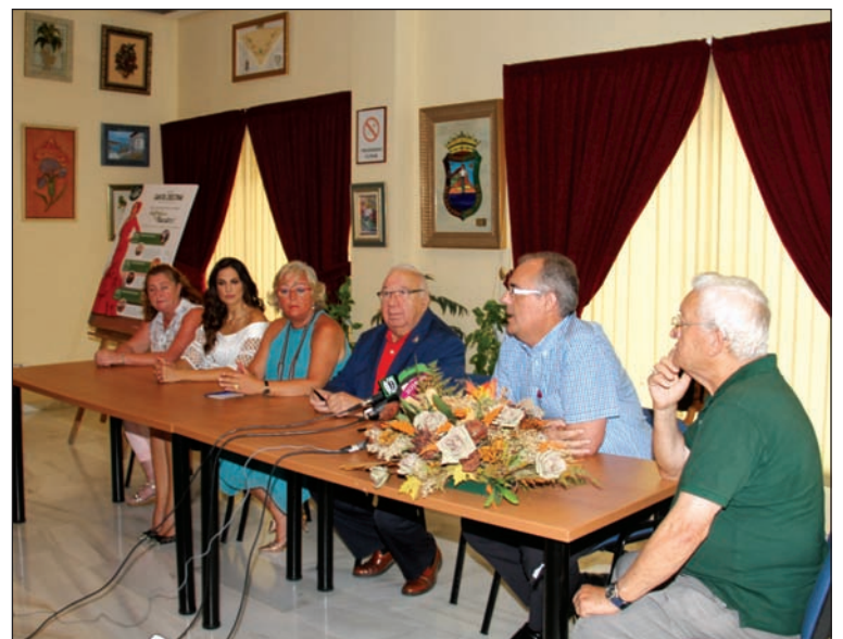
Un instante de la rueda de prensa.