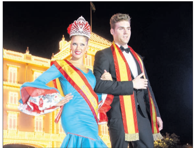
La Reina y el Mister de la Feria de 2016.