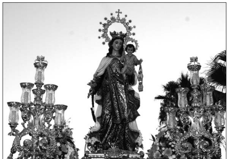
La Virgen del Carmen de Huelin.

Uno de los momentos más emotivos se produjo, un año más, al paso de la Imagen por la Peña Costa del Sol.