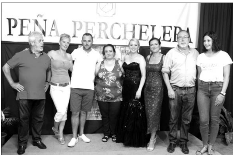
Segunda semifinal del Certamen.