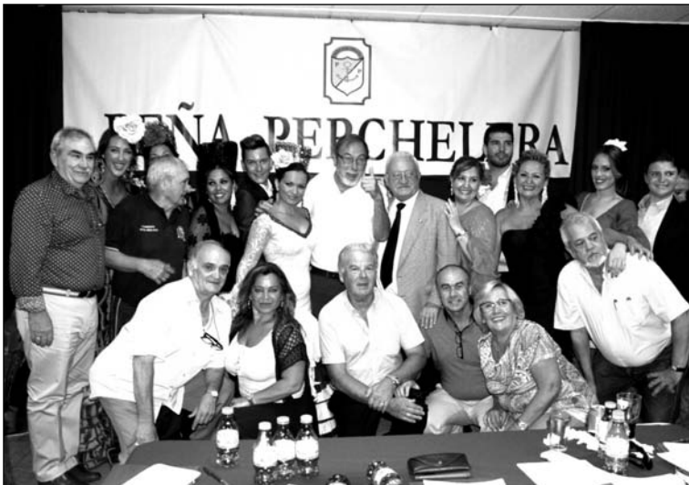
Primera semifinal del Certamen.