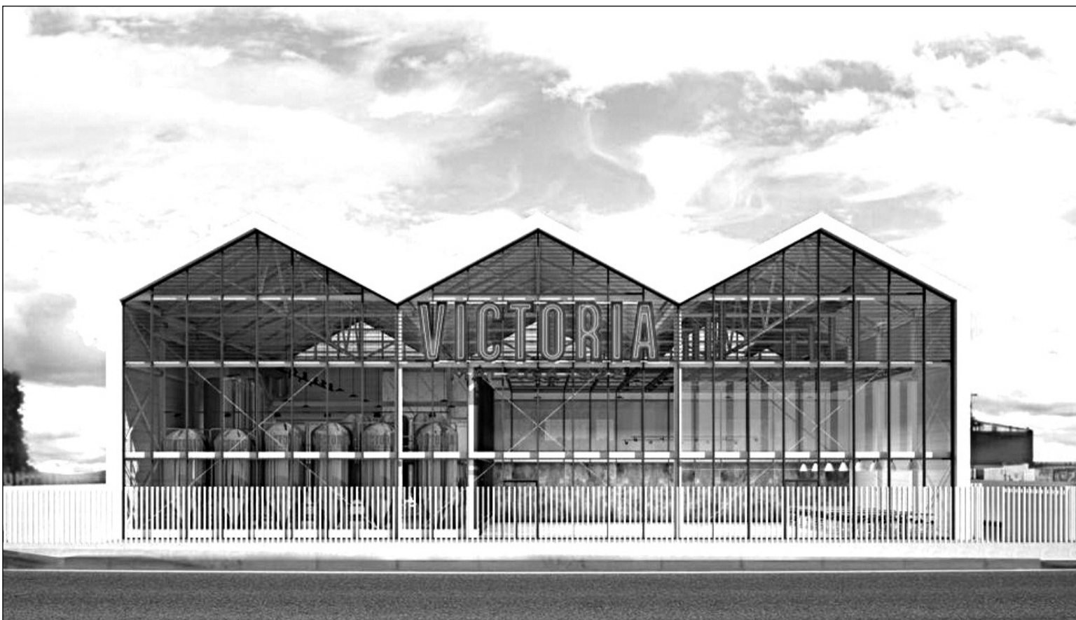
Aspecto que tendrá la nueva fábrica de Cervezas Victoria en su inauguración.