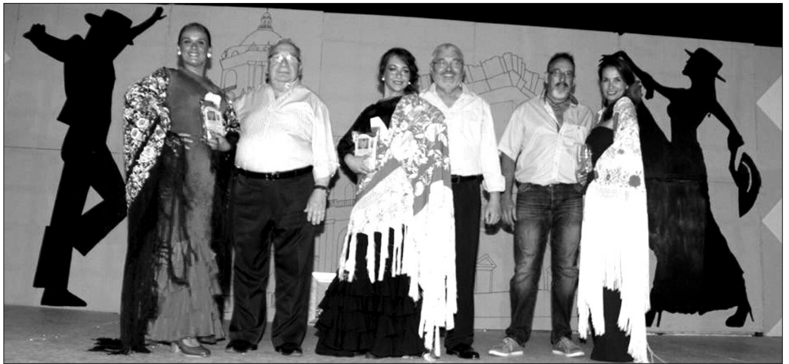
El concurso del pasado año tenía lugar en la caseta de la Peña Er Salero.