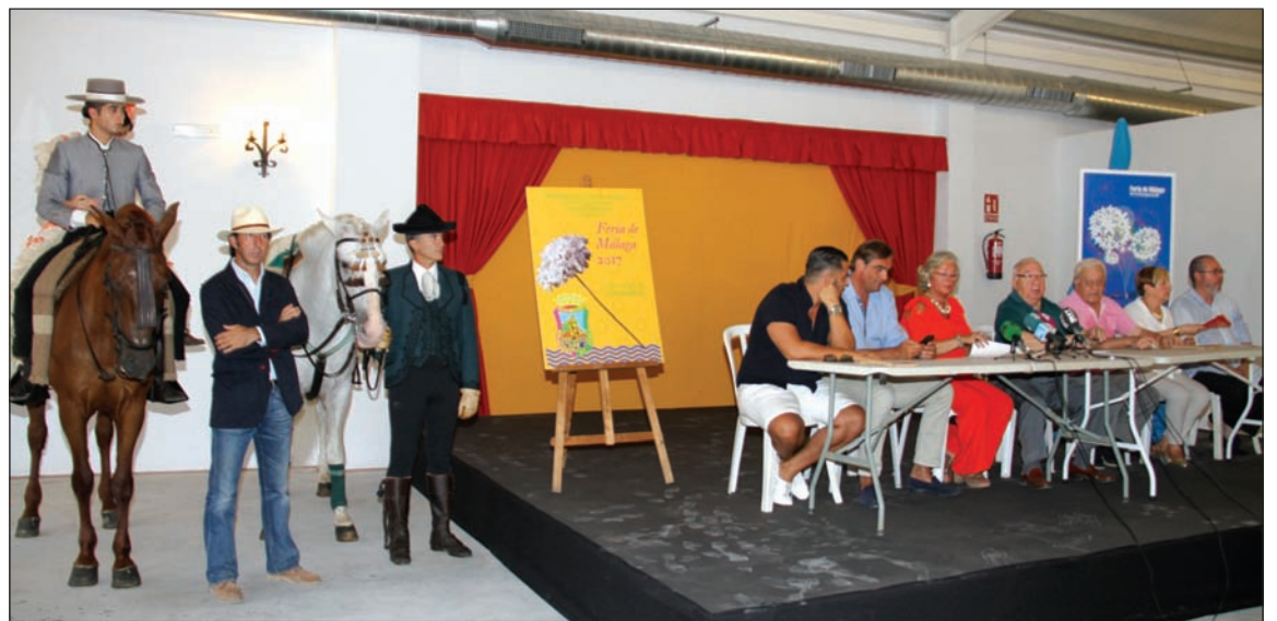
Un instante de la rueda de prensa.

la caseta de la Peña Ciudad Puerta Blanca, la elección de Reina y Mister o la entrega de premios como La Alcazaba o Málaga Por Bandera.