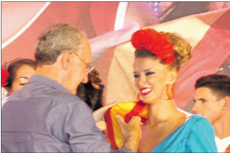
El alcalde entrega la banda a la Reina del pasado año.

modo especial a todas las entidades en su participación. Además, podrán presentar sus candidatos las Juntas de Distrito de Málaga.