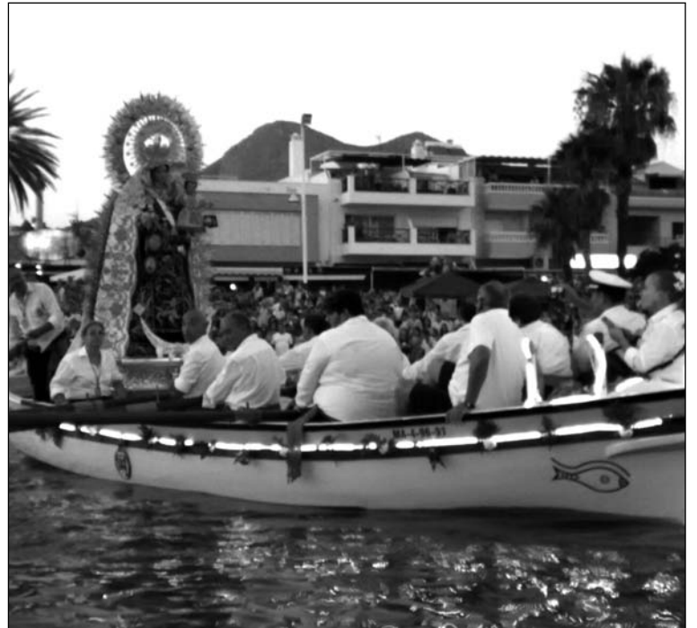
La Virgen del Carmen en la jábega de la Peña Recreativa Pedregalejo.