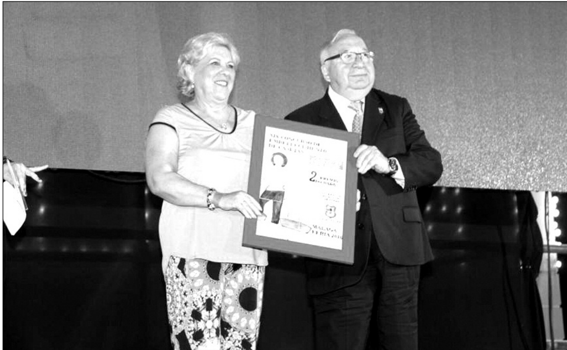
El premio del pasado año recayó en el Centro Cultural Renfe.

Este concurso es complementario al Certamen de Malagueñas de Fiesta que recientemente celebraba su gran final en el Auditorio de Tabacalera. De hecho, como es habitual, desde el Área de Fiestas del Ayuntamiento de Málaga se ha editado un trabajo discográfico con las malagueñas finalistas. Este CD será distribuido gratuitamente entre todas las entidades federadas con caseta en el recinto ferial de Cortijo de Torres, que de este modo dispondrán de las novedades en cuanto a malagueñas de fiesta de este año para poder hacerlas sonar.