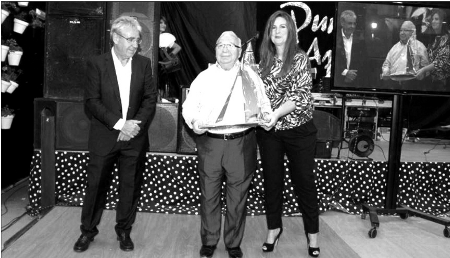
PTV entregaba el pasado año en la Feria su Premio Biznaga a la Federación Malagueña de Peñas.

La inversión en esta infraestructura rondará los 6 millones de euros y permitirá la contratación de 40 personas para la nueva fábrica, que tendrá una superficie de 3.374,26 metros cuadrados.