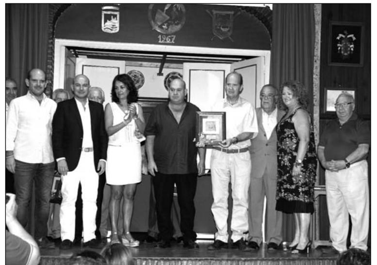
Reconocimiento póstumo a Demófilo Peláez.

Una semana antes, el 29 de julio, esta entidad federada organizaba en su sede su II Ruta de la Tapa, una actividad gastronómica que reunía a un importante número de socios.