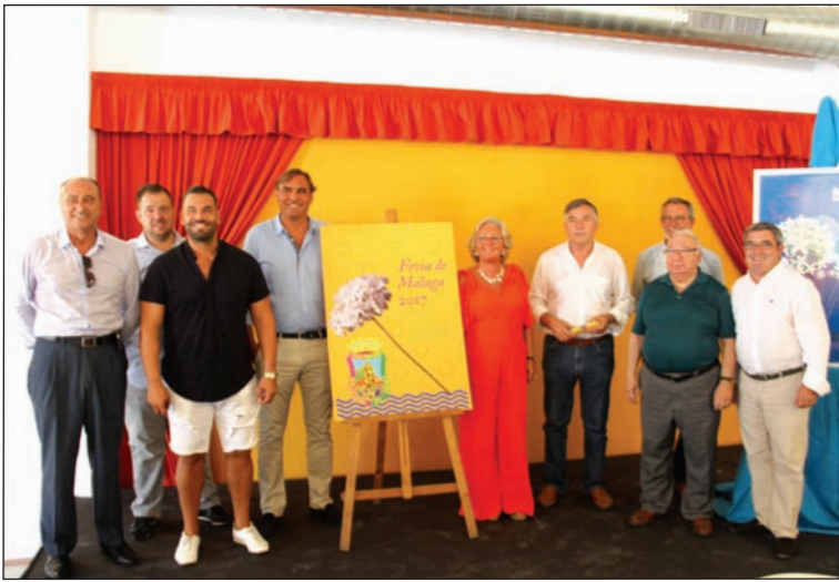
Asistentes a la presentación de las actividades.