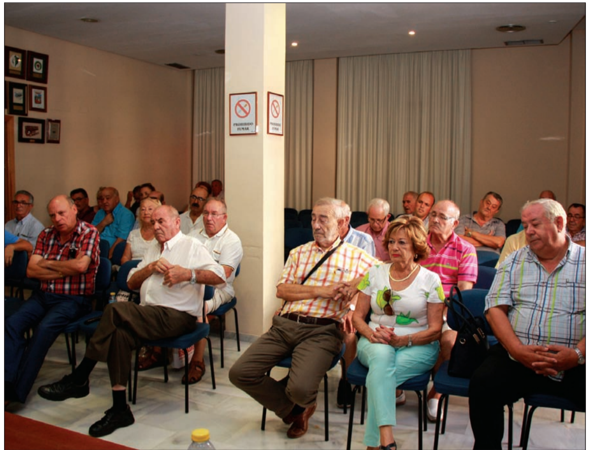
Representantes de entidades con caseta en el recinto ferial de Cortijo de Torres.