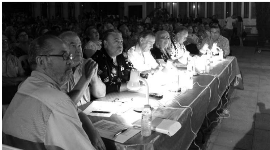
El jurado, atento a las interpretaciones de los finalistas.