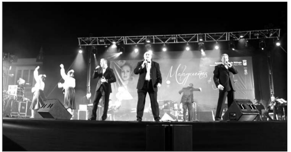
Uno de los grupos participantes en la final.