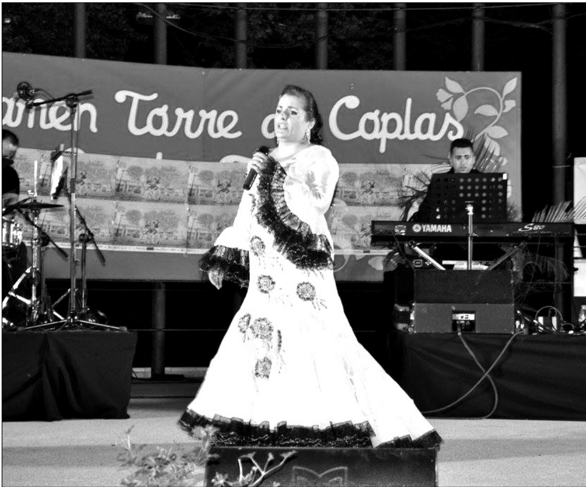
La cantante alcalaesna Marisa Martín se alzó con el primer premio.