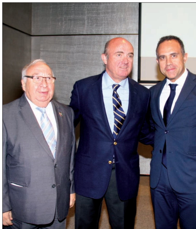
El ministro De Guindos asistió a un acto organizado por SUR y Unicaja.