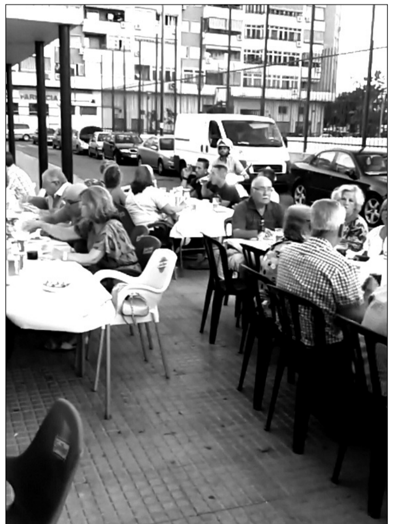
Socios en el exterior de la sede.