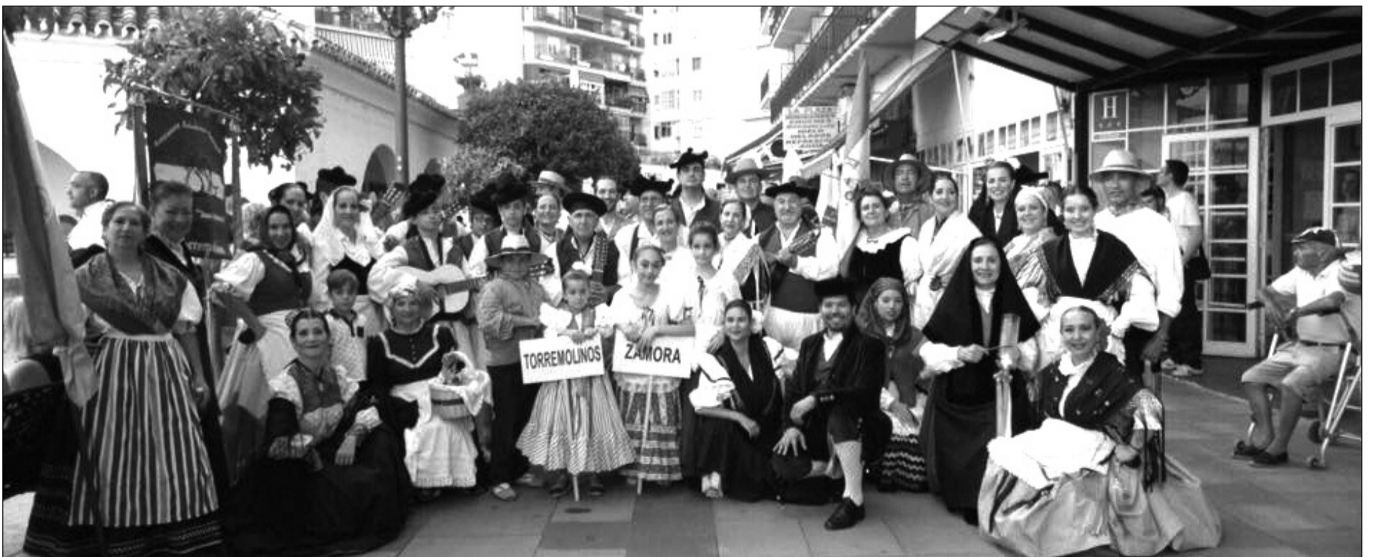
Integrantes de los diferentes grupos participantes en el festival celebrado el pasado 8 de julio.

Numerosos vecinos y visitantes se congregaron en las calles del centro de Torremolinos para disfrutar tanto de las actuaciones realizadas sobre el escenario como el pasacalles previo.