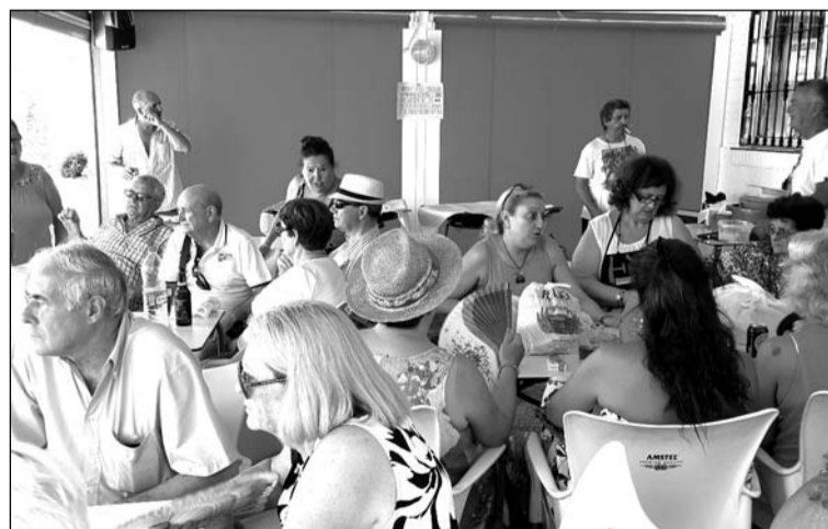
Numerosos socios se dieron cita en la sede de la entidad.