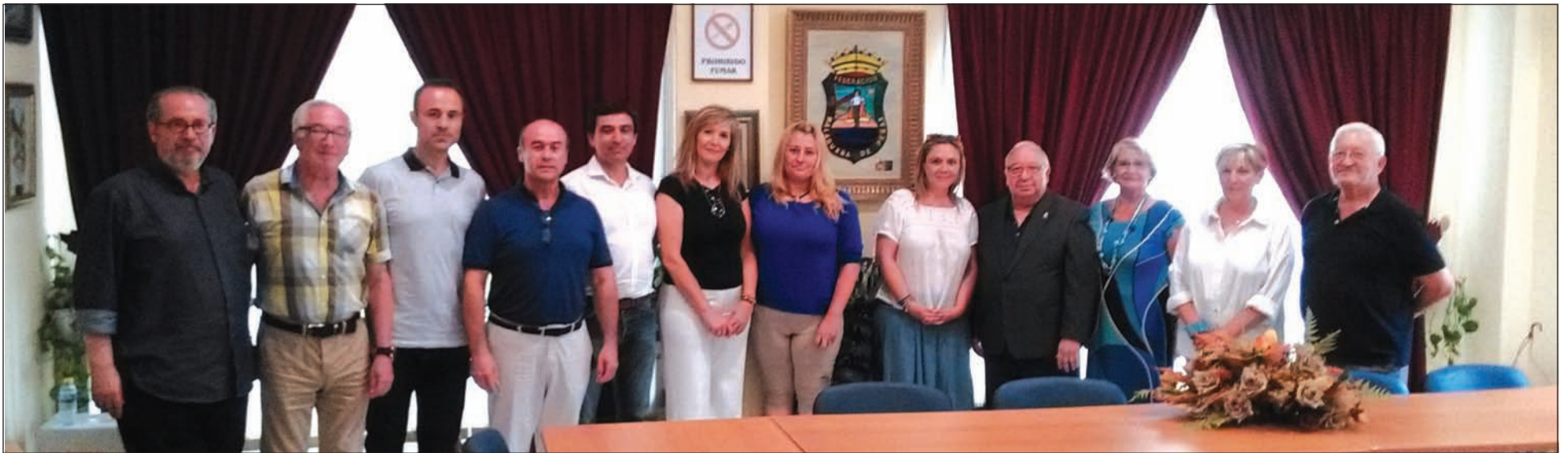
Directivos de la Federación Malagueña de Peñas y componentes de la Asociación Proyecto PEPOS, en la sede del colectivo peñista.