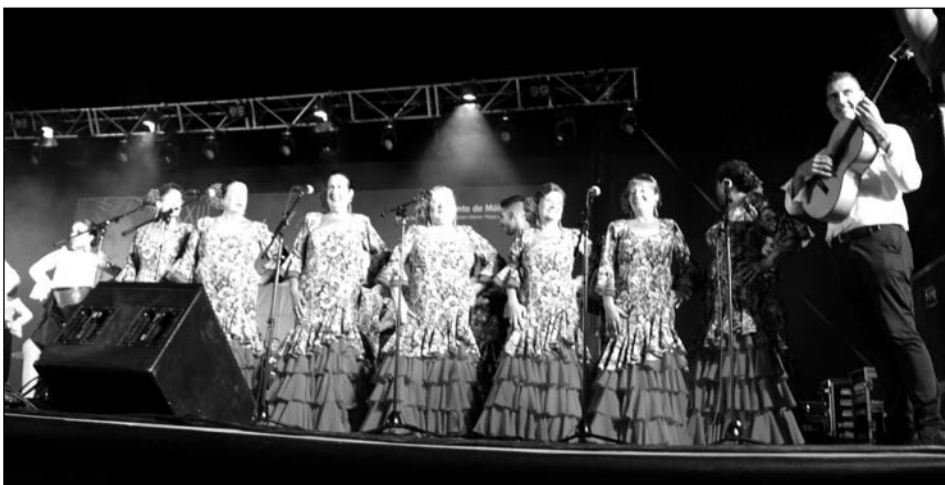
Los coros volvieron a tener presencia en el certamen.