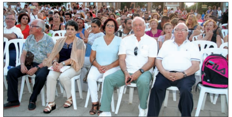
Miembros de la Federación, entre ellos su presidente, en el certamen.