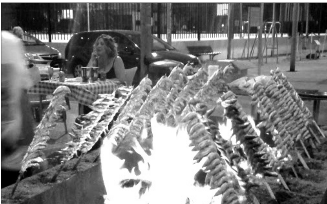
Los espetos fueron el alimento estrella de la velada.

La Peña Santa Cristina reunía el pasado 1 de julio en el exterior de su sede a unos noventa de sus socios para disfrutar una agradable velada en la que se ofrecían espetos de sardinas elaborados en la terraza de la entidad y pipirrana