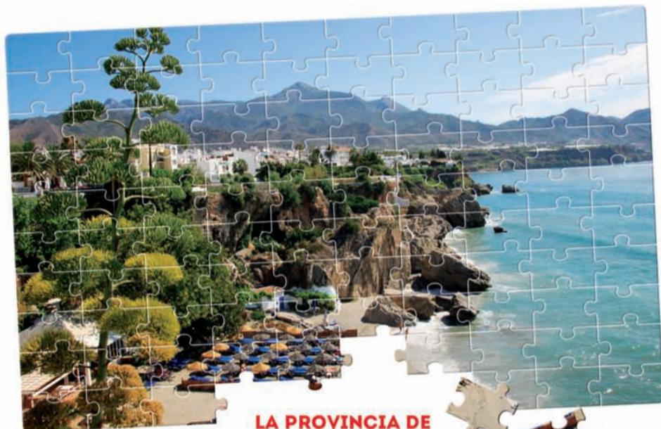
Hasta agotar existencias. Ambito de la promoción Provincia de Málaga.