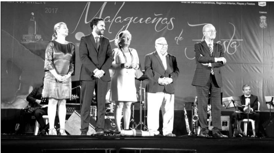
Autoridades asistentes a la entrega de trofeos, con el presidente de la Federación de Peñas.