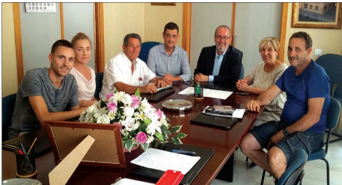
Asociación de Mayores San Julián.