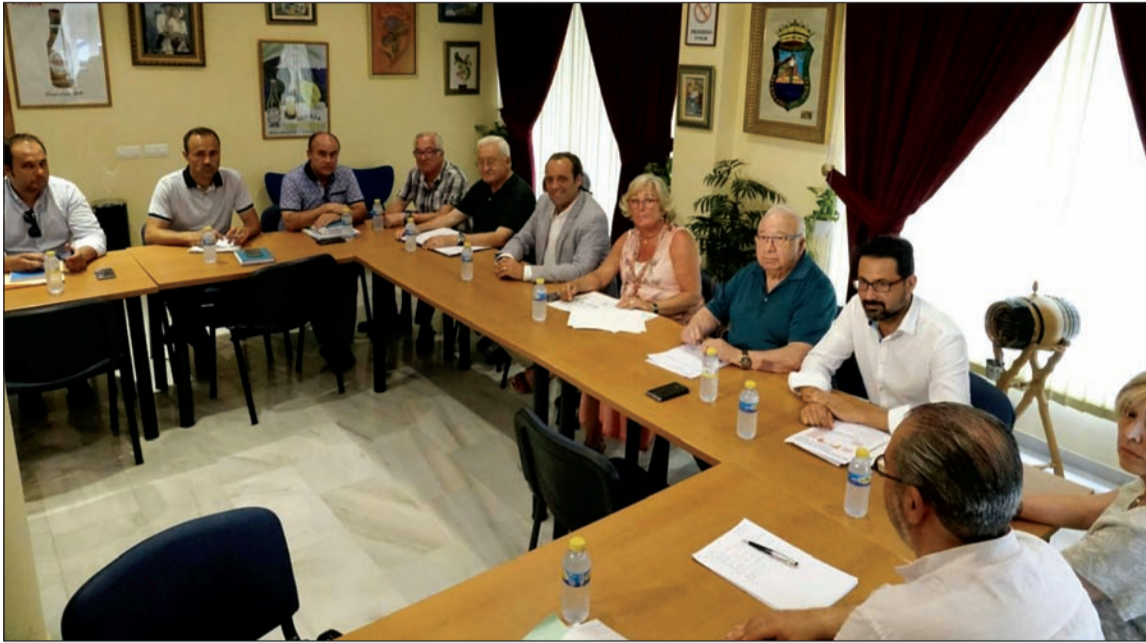
Directivos de la Federación también asistieron a la reunión.