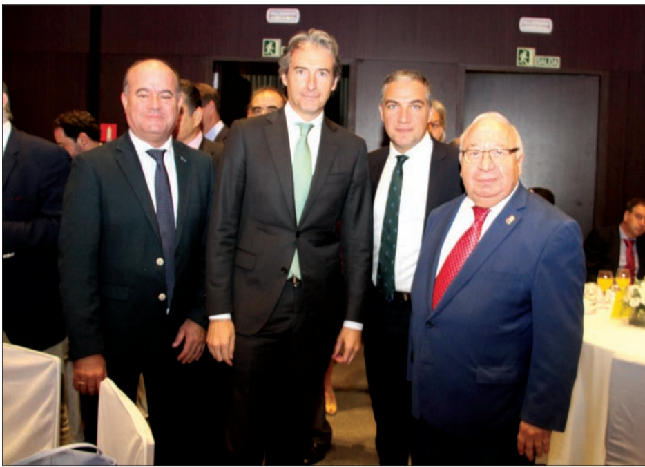
Encuentro con el ministro de Fomento, Íñigo de la Serna.

Número 629 19 de Julio de 2017 C/ Pedro Molina, 1 Tfno: 952 22 54 39 Fax: 952 21 48 82 E-mail: prensa@femape.com - la_alcazaba@hotmail.com Web: www.femape.com Edición digital: www.femape.com/laalcazabadigital Twitter: @FMPLaAlcazaba Facebook: www.facebook.com/FMPLaAlcazaba