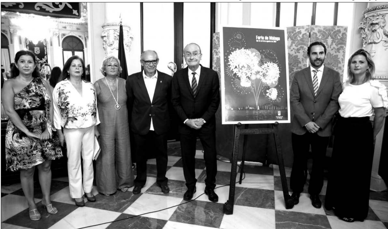
Presentación del Abanderado de la Feria en el Salón de los Espejos del Ayuntamiento de Málaga.

El itinerario de la romería se mantendrá igual que el año pasado 2016, una vez realizadas las comprobaciones y revisando que las obras del metro no afectan al recorrido. Jurado portará la Bandera oficial de Málaga al templo de la Victoria y se realizará una ofrenda floral a la Patrona.