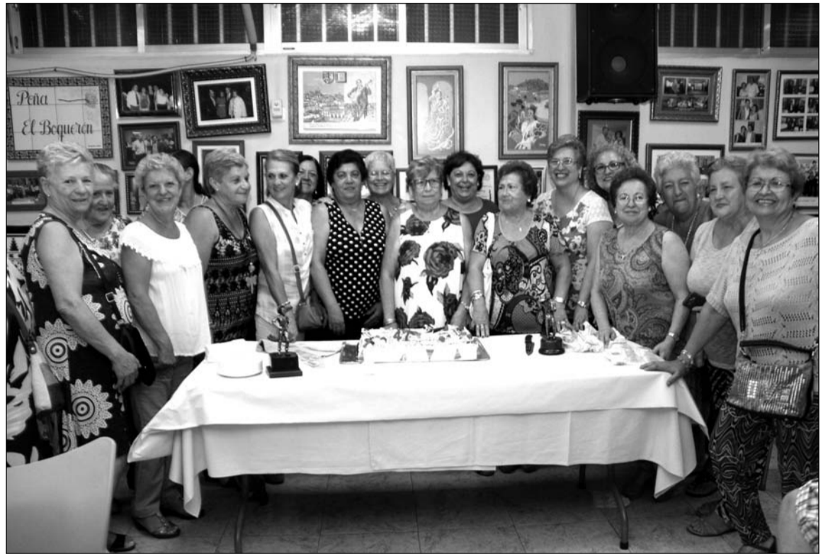
La presidenta y un grupo de socias, ante la tarta conmemorativa.