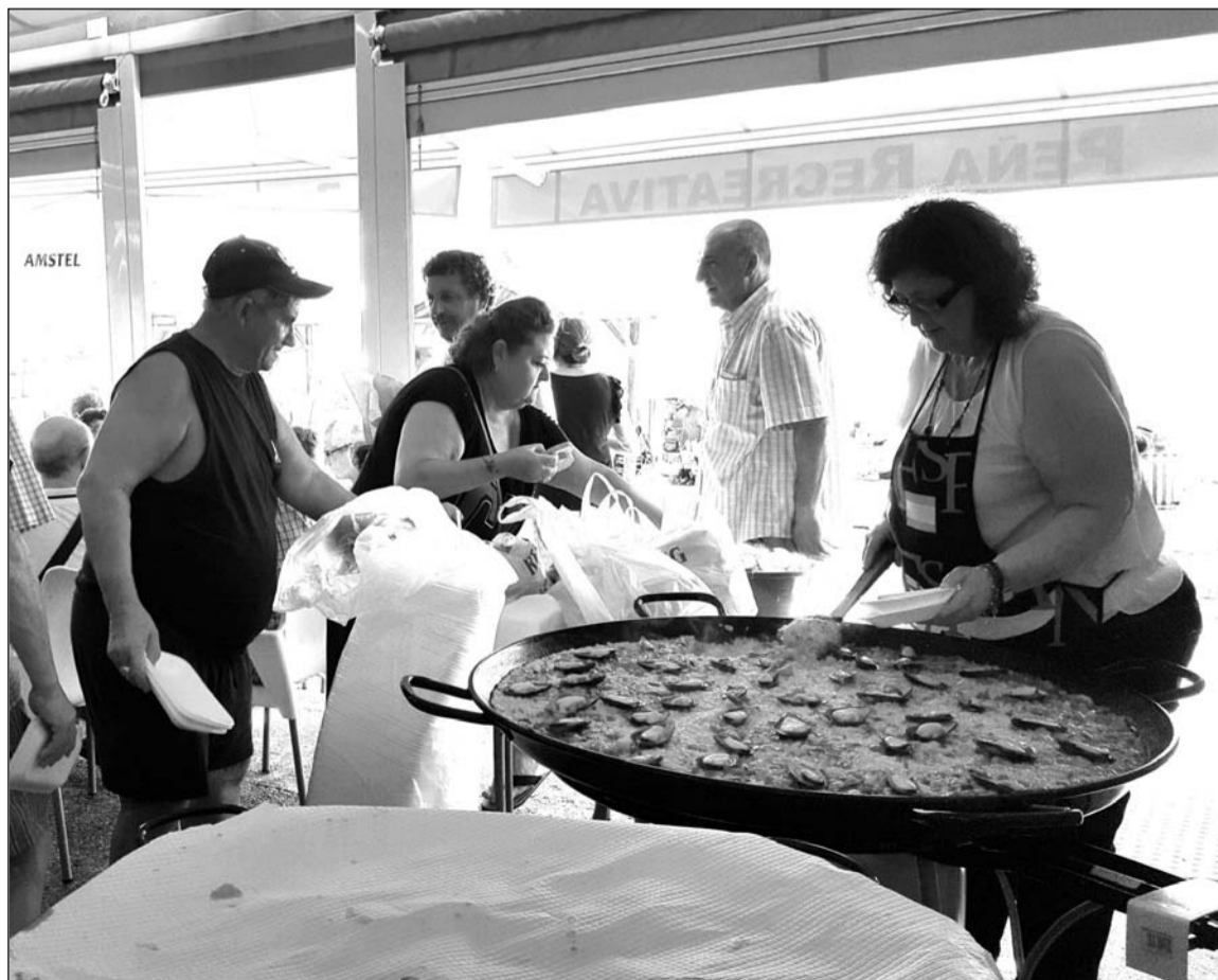
Las paellas, listas para ser servidas a los participantes en esta jornada de convivencia.