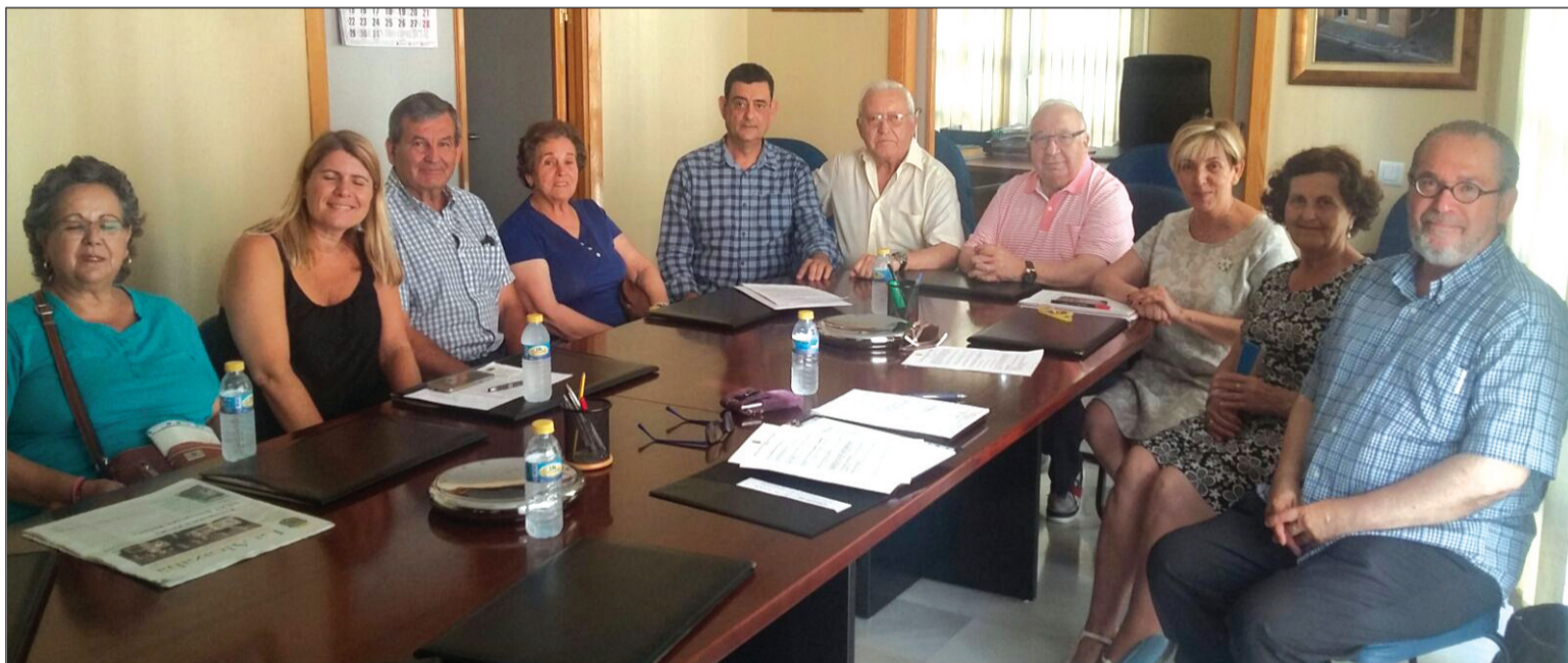
PANDA de VERdiales y Fandangos de Alfarnate.

Entre estas nuevas incorporaciones se encuentran la Panda de Fandangos y Verdiales de Alfarnate y la Asociación de Mayores San Julián; que a partir de ahora formarán parte activa de todas las actividades organizadas por parte del colectivo peñista malagueño.