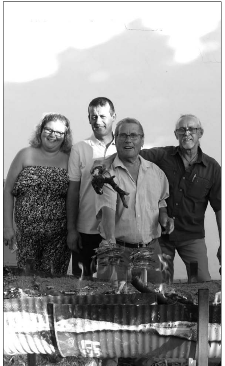
Peñistas preparando los espetos.