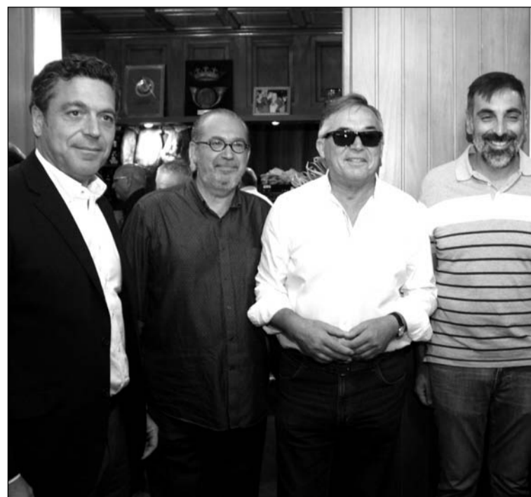
Asistentes al acto.