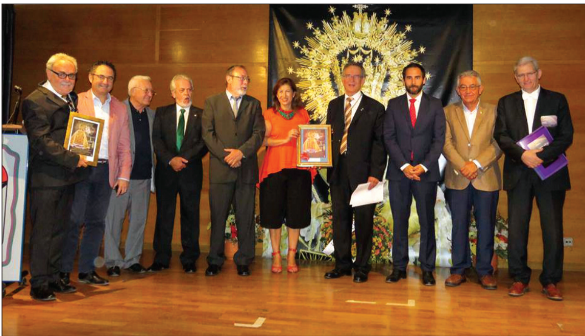
Asistentes al XXVIII Pregón Marinero en Honor a Nuestra Señora del Carmen.