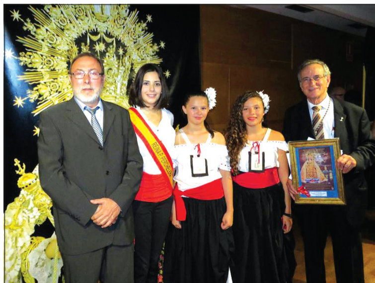
La reina y jóvenes de la entidad acudieron vestidas de margangas.