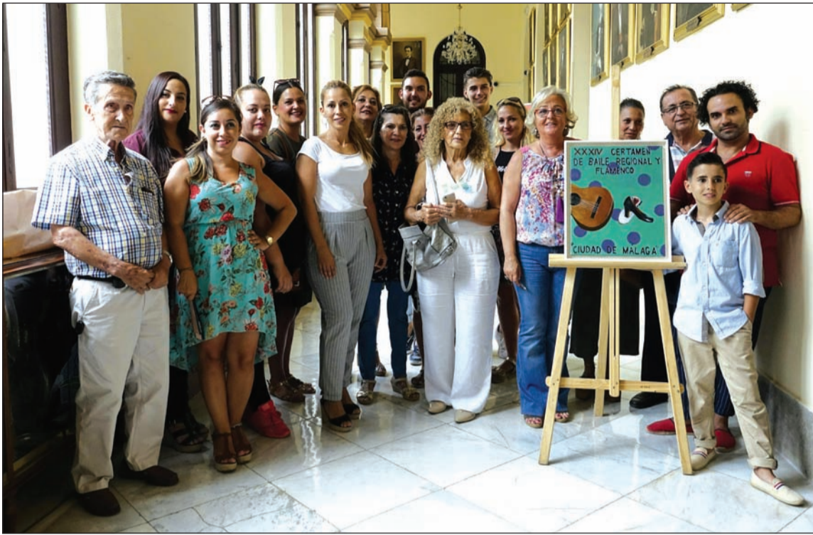
Presentación del certamen en el Ayuntamiento.