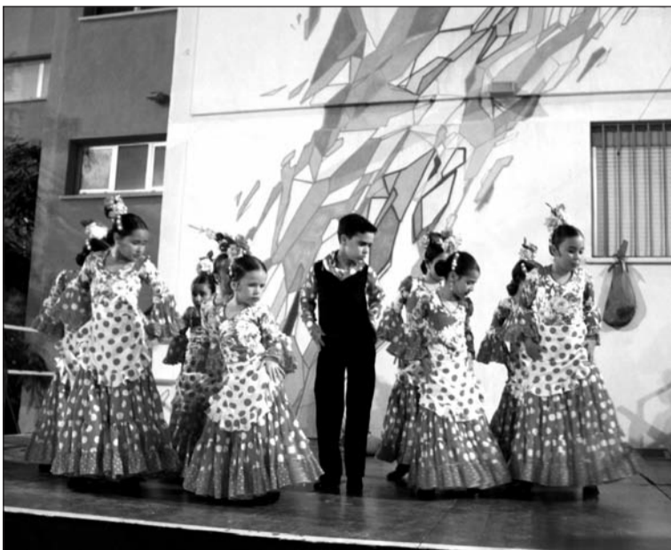
Actuación de un grupo de baile infantil.