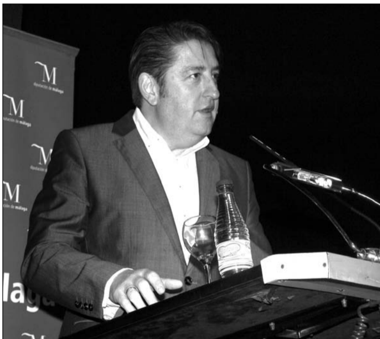
Pepelu Ramos, en el pregón del Día de Andalucía de 2013.

esta entidad perteneciente a la Federación Malagueña de Peñas, Centros Culturales y Casas Regionales 'La Alcazaba' se quería tener una jornada de convivencia con un almuerzo veraniego que tenía lugar el pasado sábado 15 de julio.