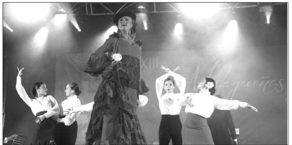
El cante y el baile se unieron en el escenario.