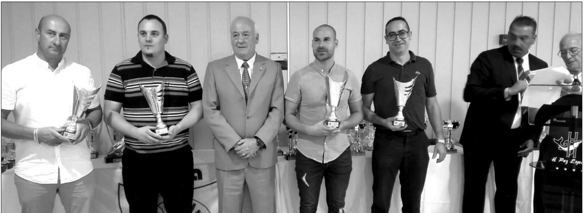
Acto de entrega de trofeos para los equipos de la Peña El Duro.