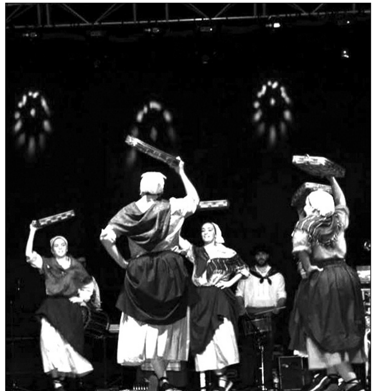
Una de las agrupaciones invitadas.