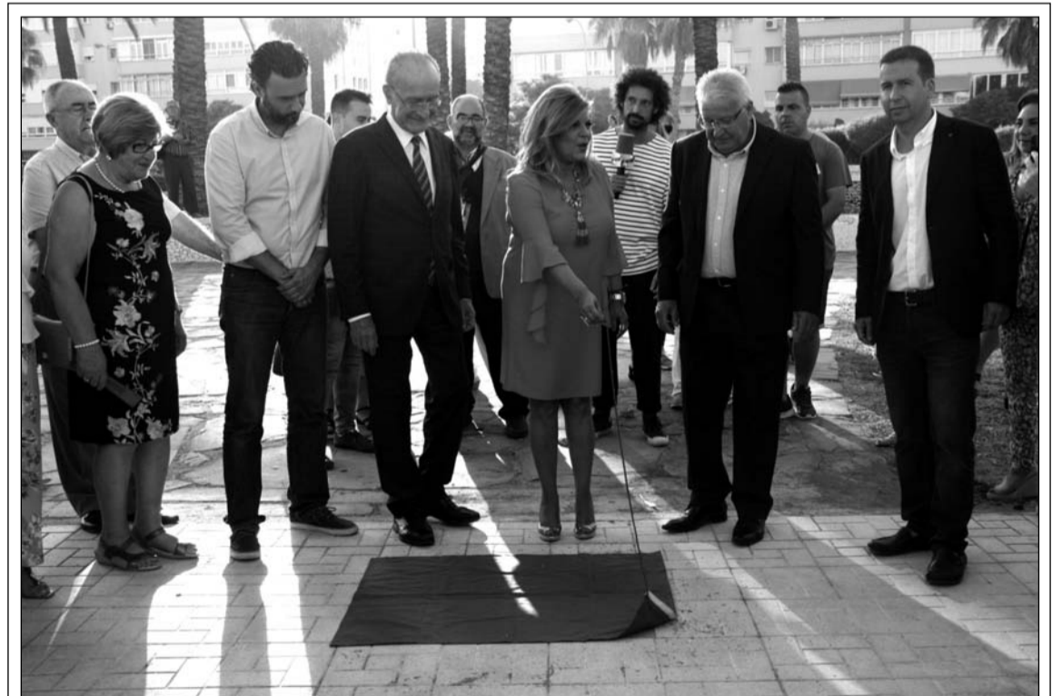
La Asociación de Vecinos Torrijos de Huelin ha concedido a Terelu Campos el premio Marengo de Oro, un galardón que conceden a malagueños ilustres vinculados con la ciudad. Así, en esta ocasión la condecoración ha sido para la colaboradora de televisión, que se ha unido a la lista de malagueños ilustres como su madre, que ya lo recibió en el año 2010.