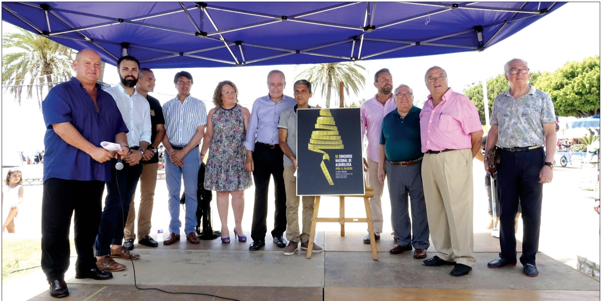
Acto de presentación del cartel del 51º Concurso de Albañilería de la Peña El Palustre.