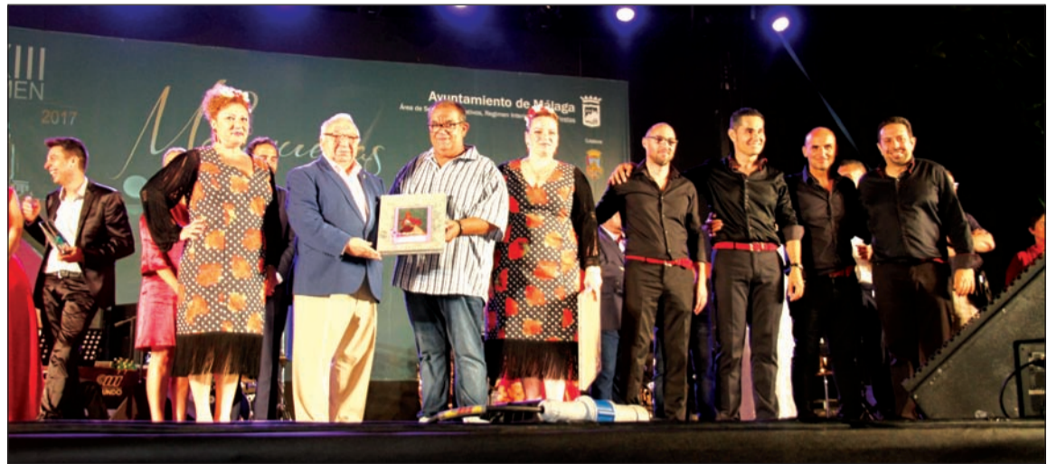
El presidente de la Federación de Peñas hace entrega del tercer premio.

Aún no entrando en concurso, se ha configurado el baile como parte esencial del Certamen, por lo que atañe a la difusión que se persigue su acompañamiento.