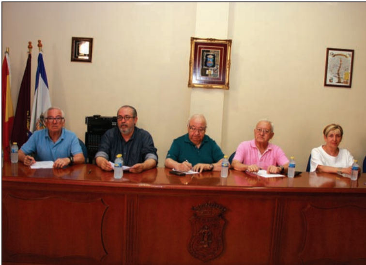
Componentes de la junta directiva en la reunión informativa.