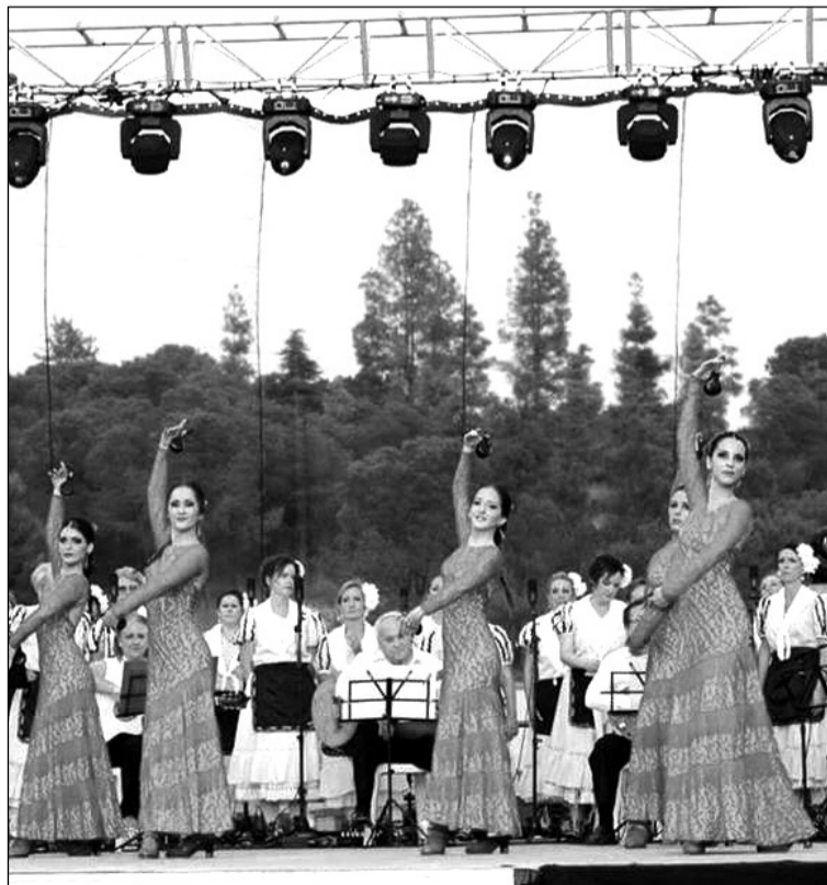
Uno de los grupos de Solera.

Se contó con la participación del Grupo de Danzas 'Pan y Guindas' de Palencia, el Grupo Folclórico Nuestra Señora de los Dolores de Murcia y el Coro Amanecer, la Escuela Panda de Verdiales y el Grupo Folclórico Solera, estos tres últimos de Alhaurín de la Torre.