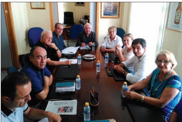
Imagen del encuentro celebrando en la sala de juntas de la Federación.

En este sistema de protección de la víctima en caso de peligro, el perro disuade al agresor para evitar su acercamiento a la mujer el tiempo necesario hasta que acuden los Cuerpos de Seguridad. La entidad que ha iniciado el desarrollo de este programa se ha fijado como objetivo la protección e integración de la víctima, cubriendo sus necesidades en materia de seguridad, integración social, formación, superación del miedo y aumento de su autoestima.