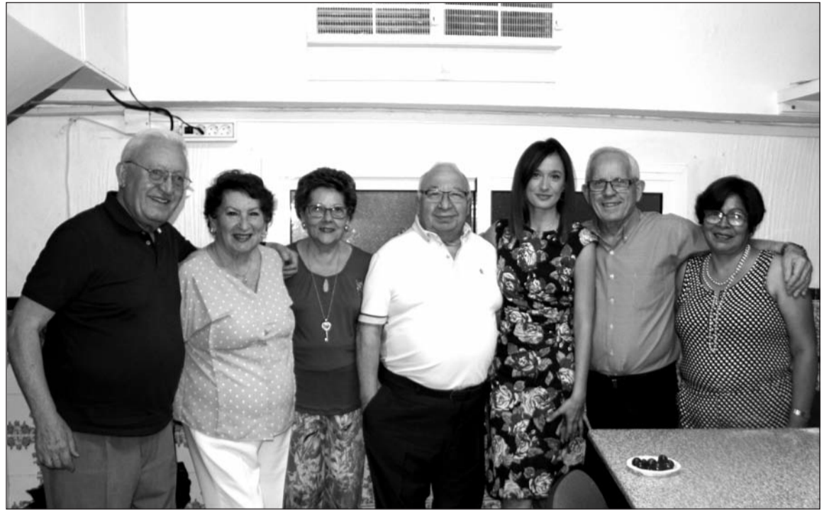
Invitados por el presidente a la comida de hermandad de la Peña los Rosales.