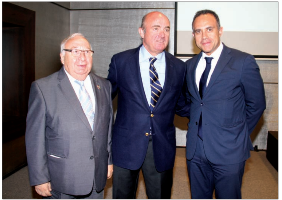
Acto junto al ministro de Economía, Industria y Competitividad, Luis de Guindos.