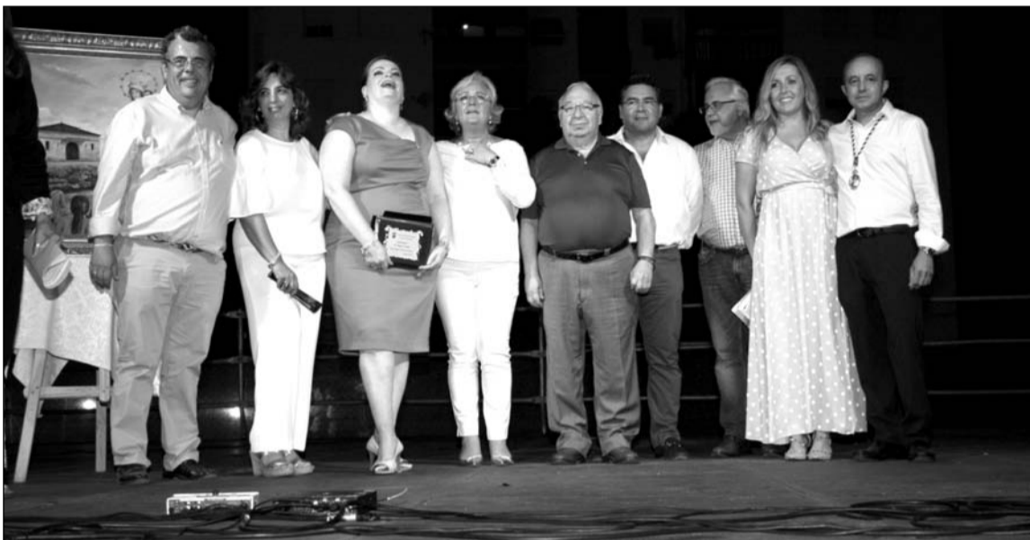
Acto de inauguración de las fiestas del distrito.