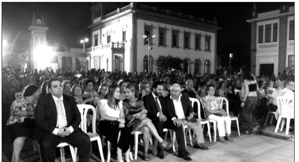
Aspecto que presentaba el auditorio de Tabacalera, con un lleno total.