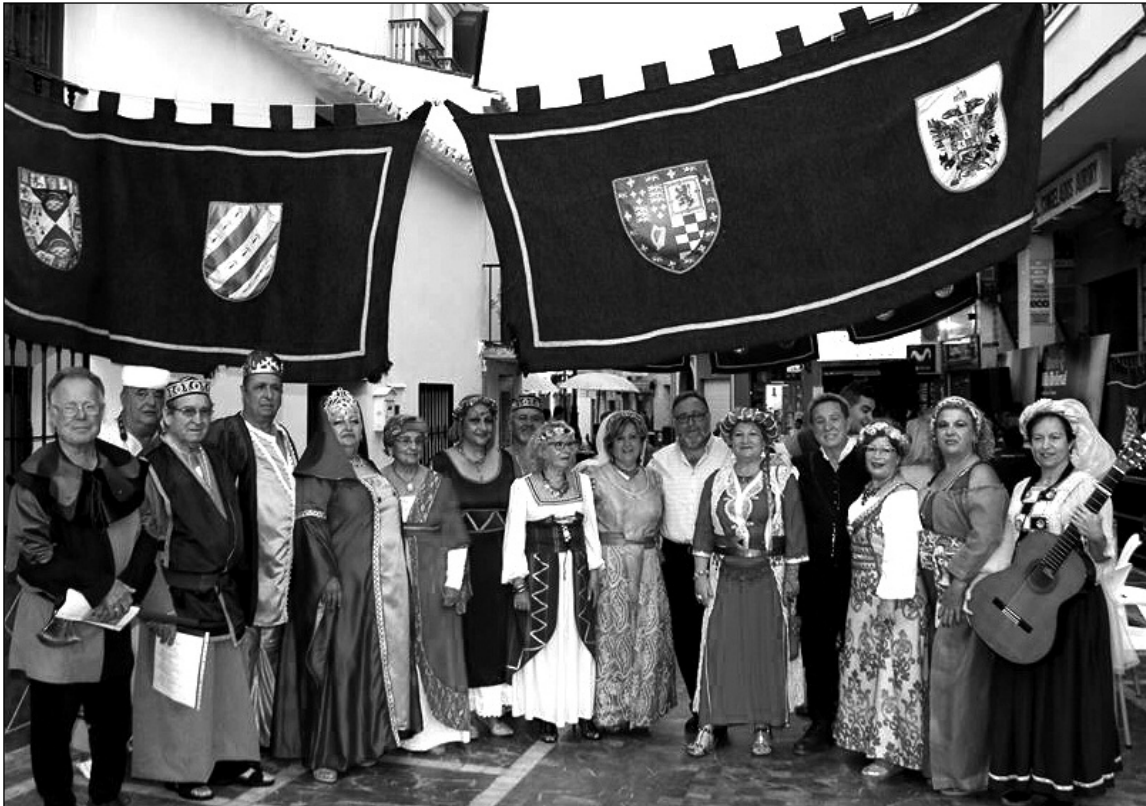
Componentes de la asociación por las calles del municipio.