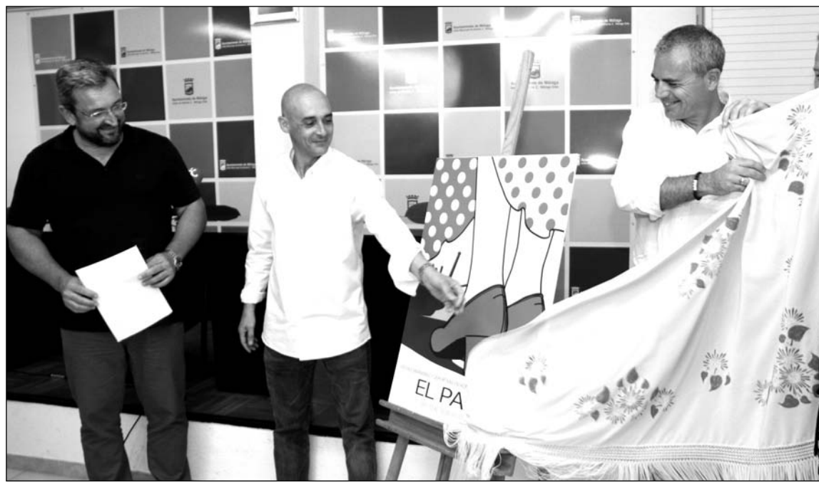
Instante en el que se descubre el cartel.

Además, el domingo 16, la Peña El Palustre ofrecerá la Paella Popular y se procederá a la presentación del Cartel de su 51º Concurso de Albañilería.