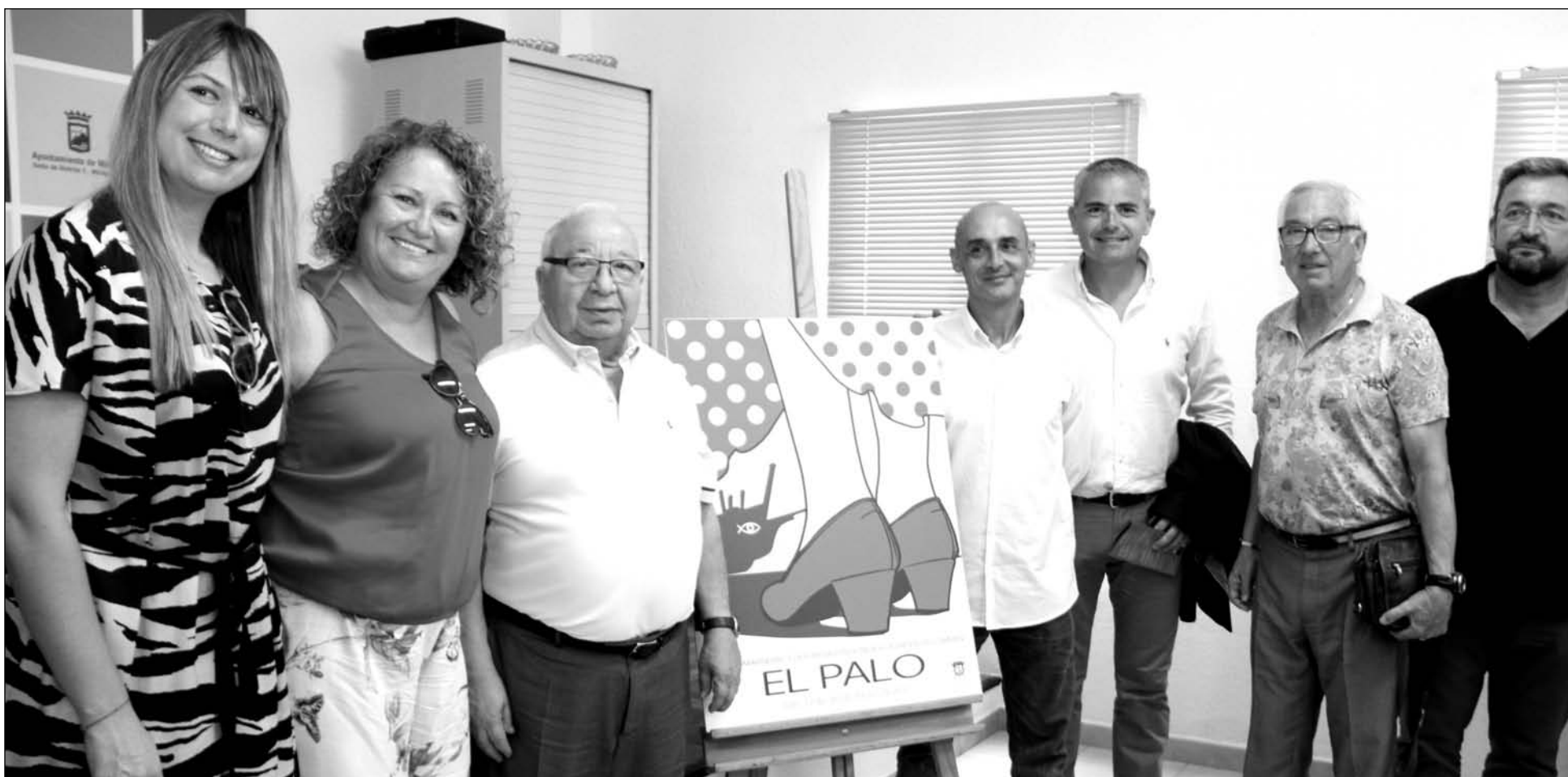
Asistentes al acto de presentación del programa de las fiestas paleñas.