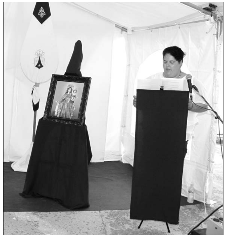
Un instante del pregón y presentación del cartel.