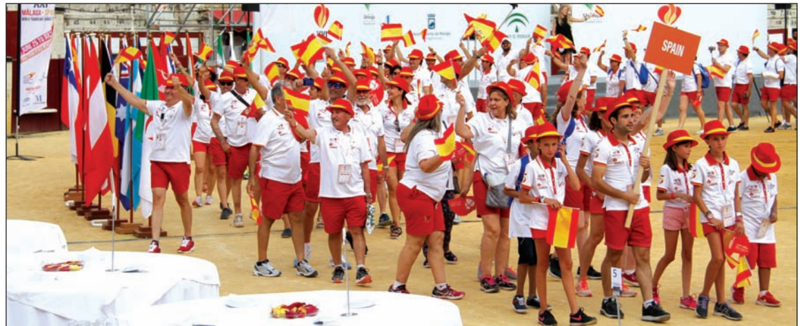
Entrada de la delegación española al ruedo de La Malagueta.

Son 17 las disciplinas que entran en competición desde el pasado lunes, repartidos en 11 espacios deportivos y recreativos de la ciudad: golf, baloncesto, atletismo, petanca, tenis de mesa, tenis, squash, voleibol, ciclismo, bádminton, bolos, kayak, dardos, natación, pádel, triatlón virtual y carrera urbana.