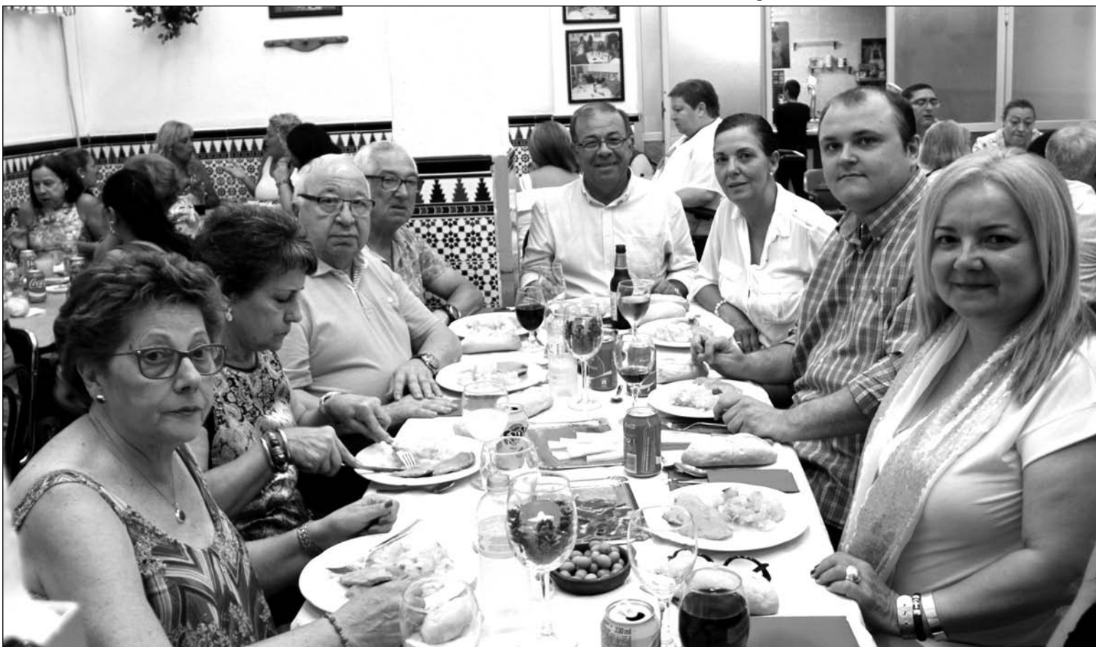
Un instante de la comida de hermandad organizada por esta entidad.

El campamento urbano, que se desarrollará de 9 a 14 horas, tiene limitadas las plazas a 15 participantes.