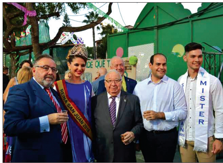
Recorrido por el recinto ferial de Alhaurín de la Torre.