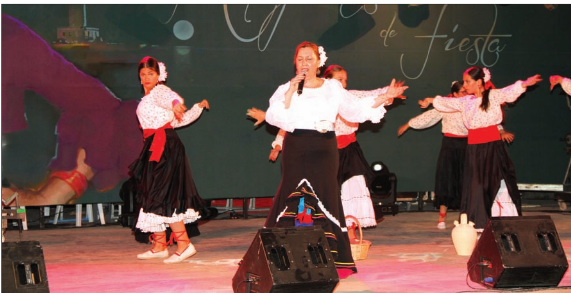
Una de las participantes en la segunda semifinal.

◆ Federación Malagueña de Peñas, Centros Culturales y Casas Regionales 'La Alcazaba'