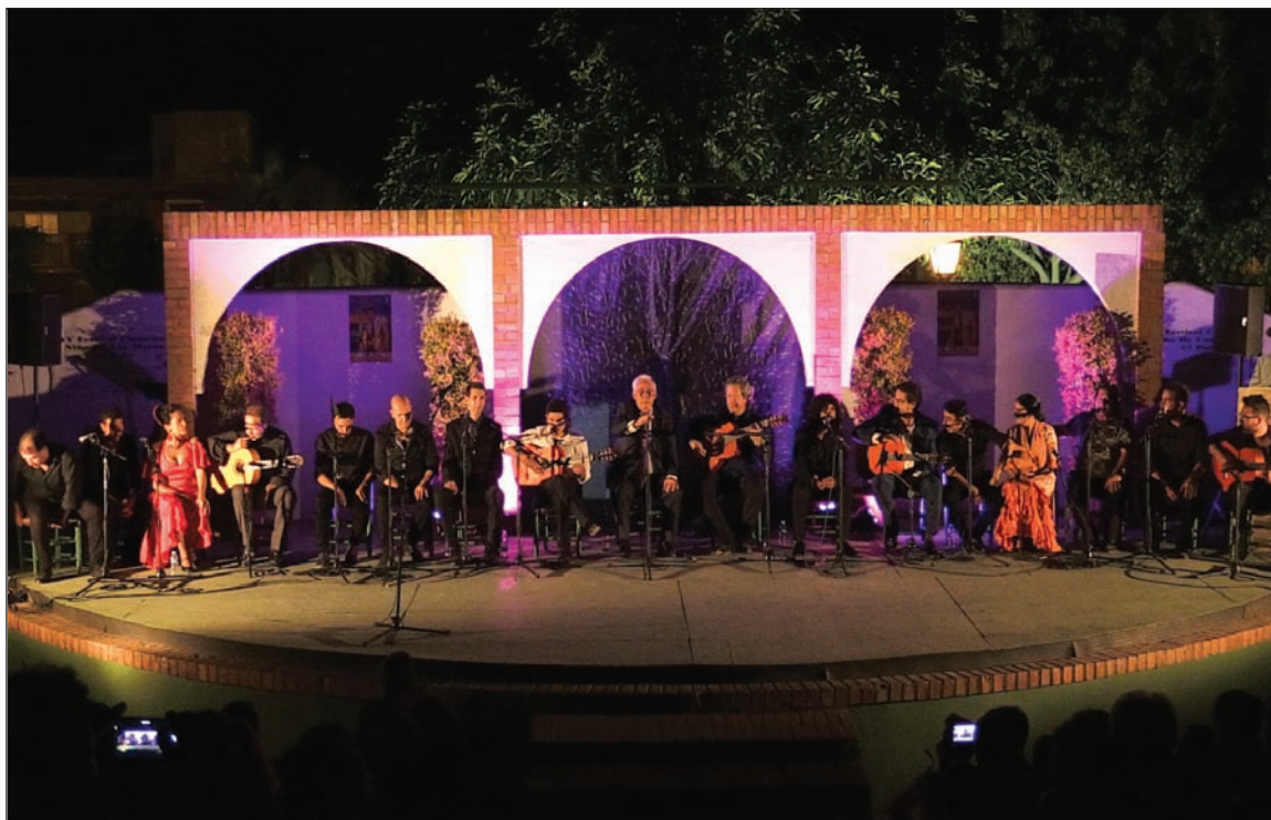
Todos los artistas sobre el escenario en el fin de fiesta.