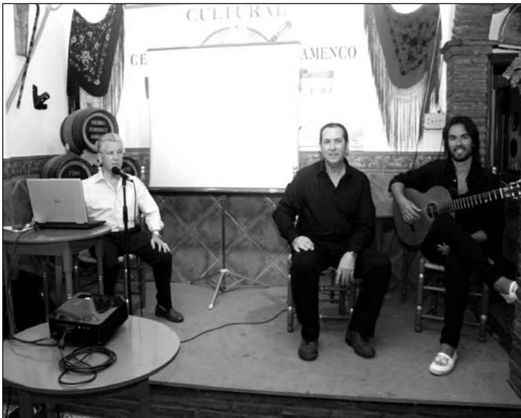
Un instante del acto.