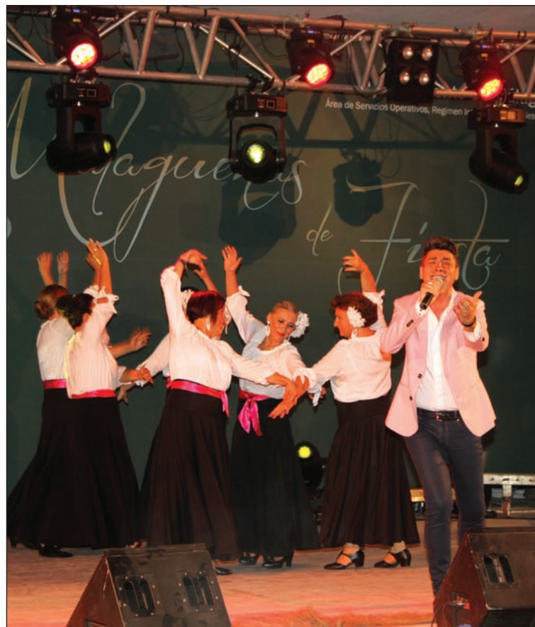
La canción y el baile se fusionan en las Malagueñas de Fiesta.

TESESA Diseño y Fabricación de Puertas, Armarios y Parquet