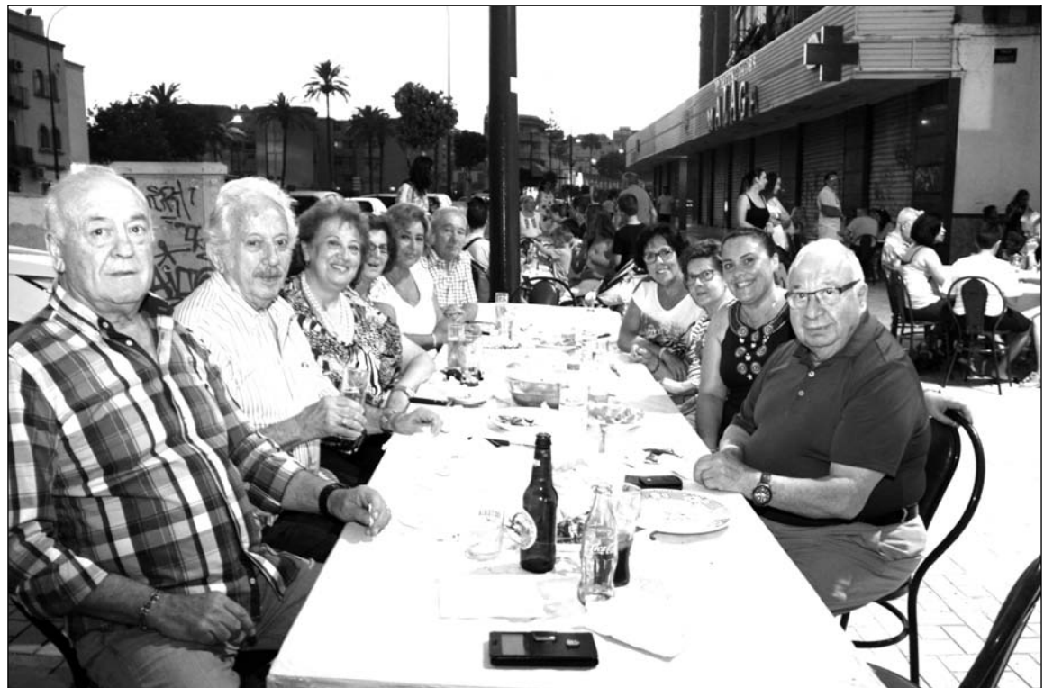
Un instante de la veladilla en el exterior de la sede.