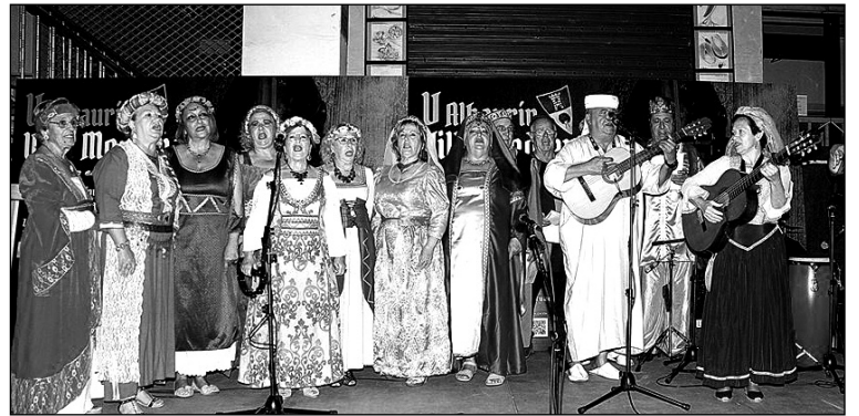
Actuación sobre un escenario.