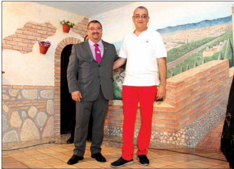
El presidente impuso el escudo de oro al autor del cartel.