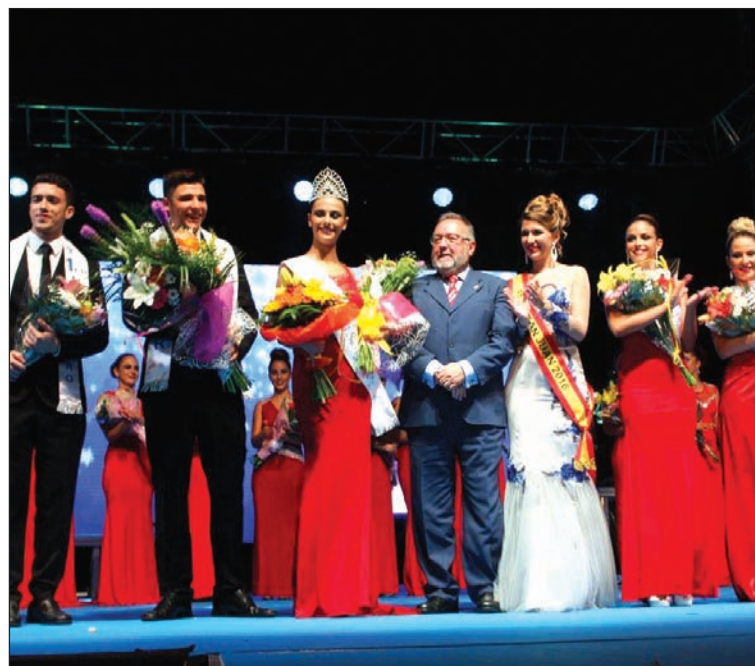
El alcalde de Alhaurín de la Torre, con las reinas y misters vencedores.