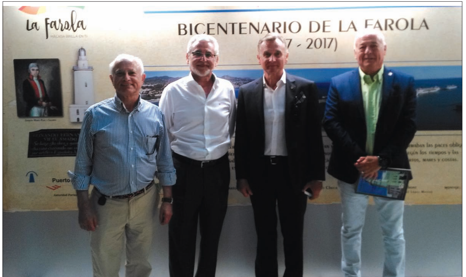
La presentación tuvo lugar en el Instituto de Estudios Portuarios.