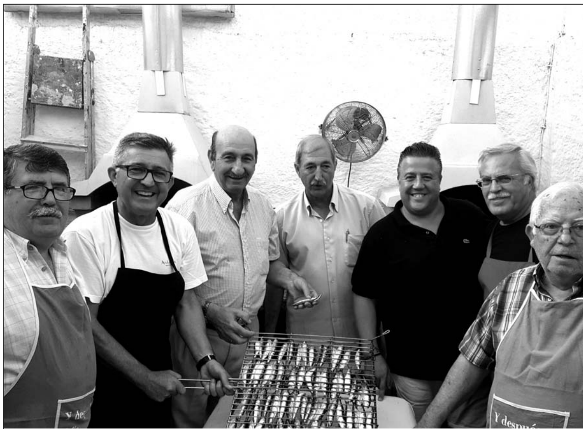
Componentes de la entidad preparan las sardinas en la barbacoa.

Y en la Agrupación Cultural Telefónica, perteneciente a la Federación Malagueña de Peñas, esta tradición se lleva a cabo año tras año, no en la playa por obvias circunstancias, sino en la sede de la entidad, pero tratando y consiguiendo dar el ambiente propio de lo que es la Verbena de San Juan. Por ello, casi 150 personas se reu-