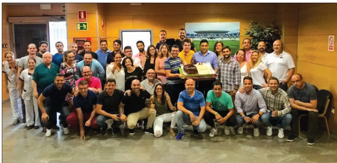
Compañeros de Basti, en la celebración de su cumpleaños.