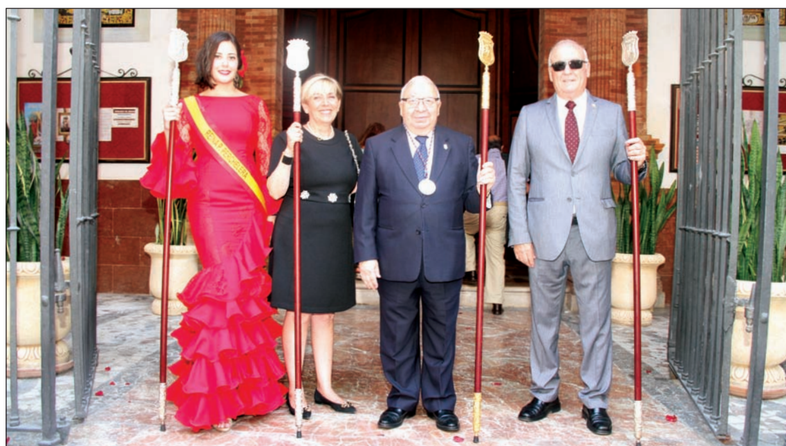
Miembros de la Federación de Peñas antes de iniciarse la procesión de los Santos Patronos.