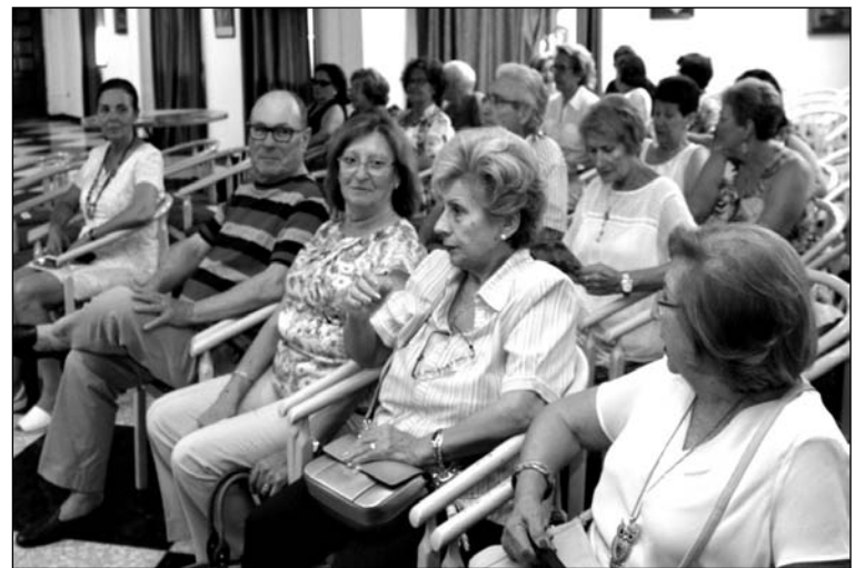
Socios disfrutando de esta muestra teatral y poética.

A la semana siguiente, el viernes día 9, se convocaba el II Concurso de Repostería, en un evento que igualmente tenía lugar en la terraza.