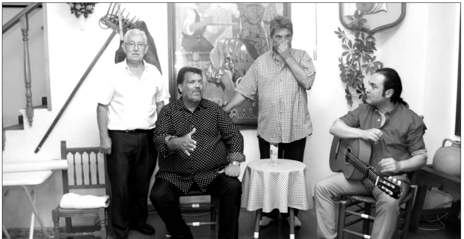
Actuación flamenca celebrada en la sede de la Peña Fosforito.

De este modo, se reúnan en la sede social de la entidad para proceder en primer lugar a disfrutar de una comida de hermandad y posteriormente de un espectáculo flamenco sobre el escenario con cante y toque que resultó del gusto de todos los aficionados asistentes a esta actividad.