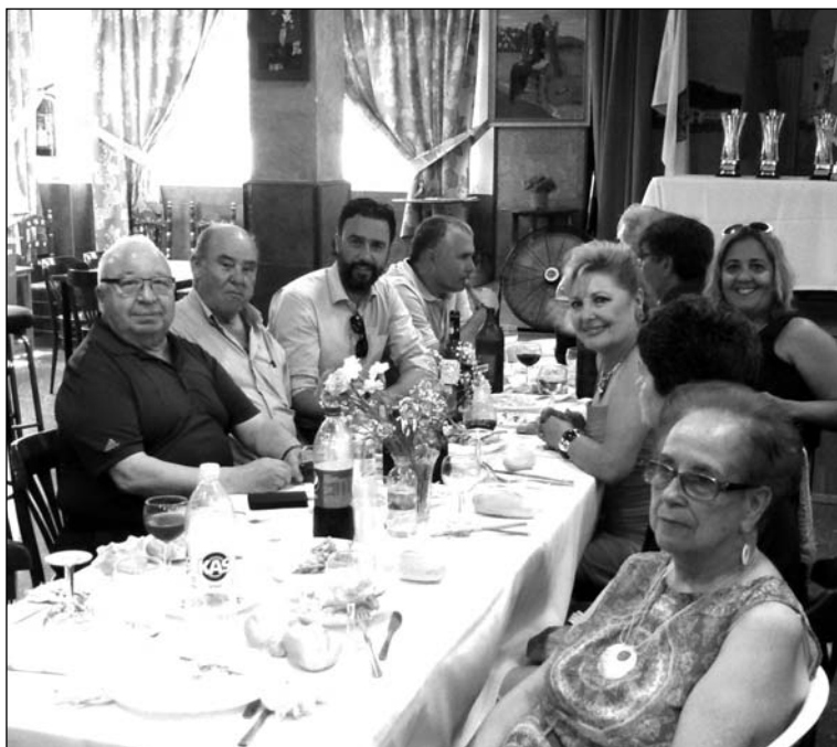
El presidente y directivos con algunos de los invitados.