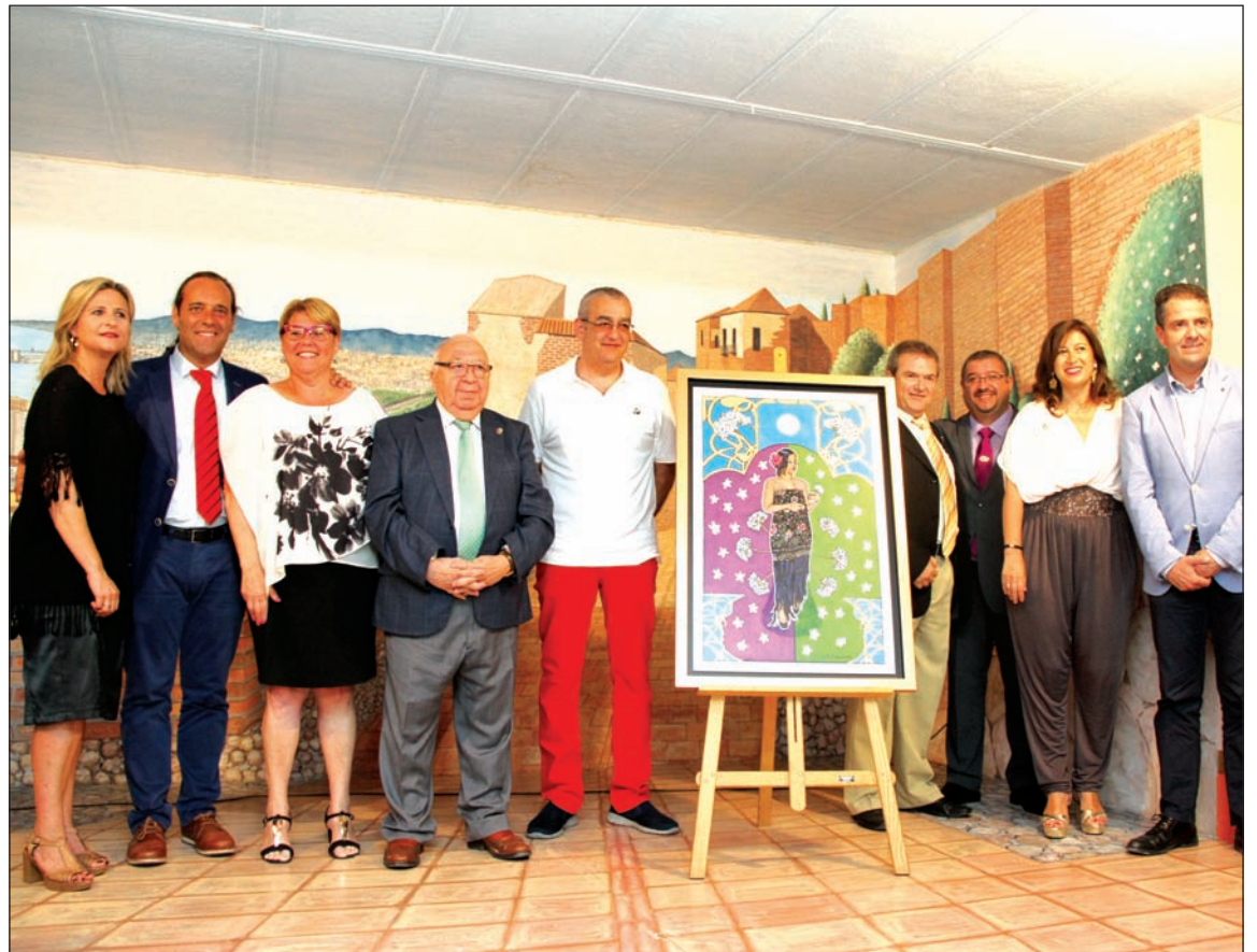
Acto de presentación del cartel.