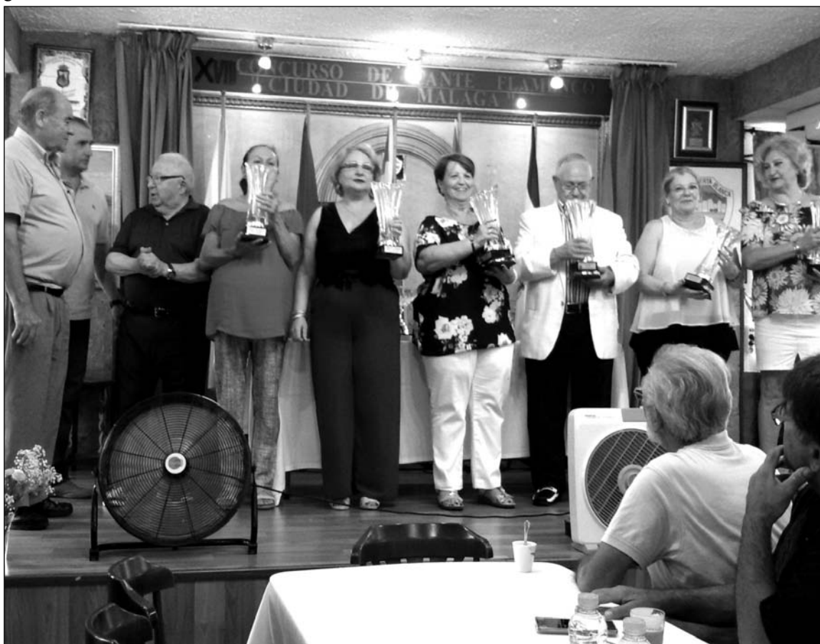
Los ganadores de los torneos muestran sus trofeos.

De cara al mes de julio, desde la Peña Ciudad Puerta Blanca se prepara para el sábado día 8, al mediodía, una comida de hermandad en la que se degustará la popular mariscada entre todos los socios.