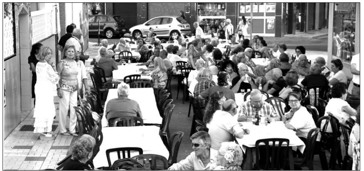
Aspecto exterior de la sede.