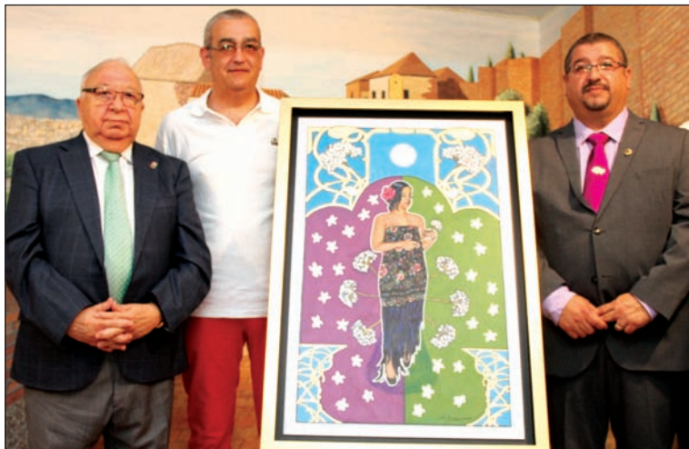
El presidente de la Federación, el autor y el presidente de la entidad.