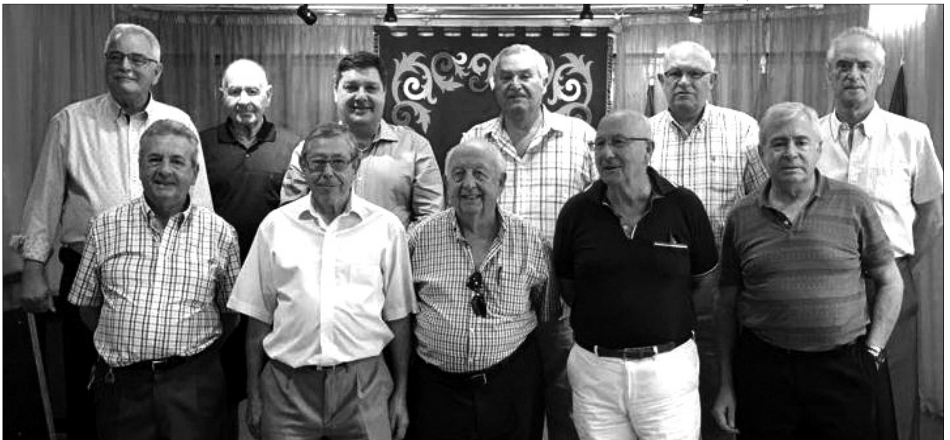
Directivos de la Casa de Melilla con representantes de la Ciudad Autónoma.

La Casa de Melilla en Málaga recibió la visita de representantes de la Ciudad Autónoma de Melilla, en su sede de Plaza de Basconia, donde se trató del tradicional viaje que cada año realiza la entidad melillense en Málaga, a la Feria de Septiembre de Melilla.