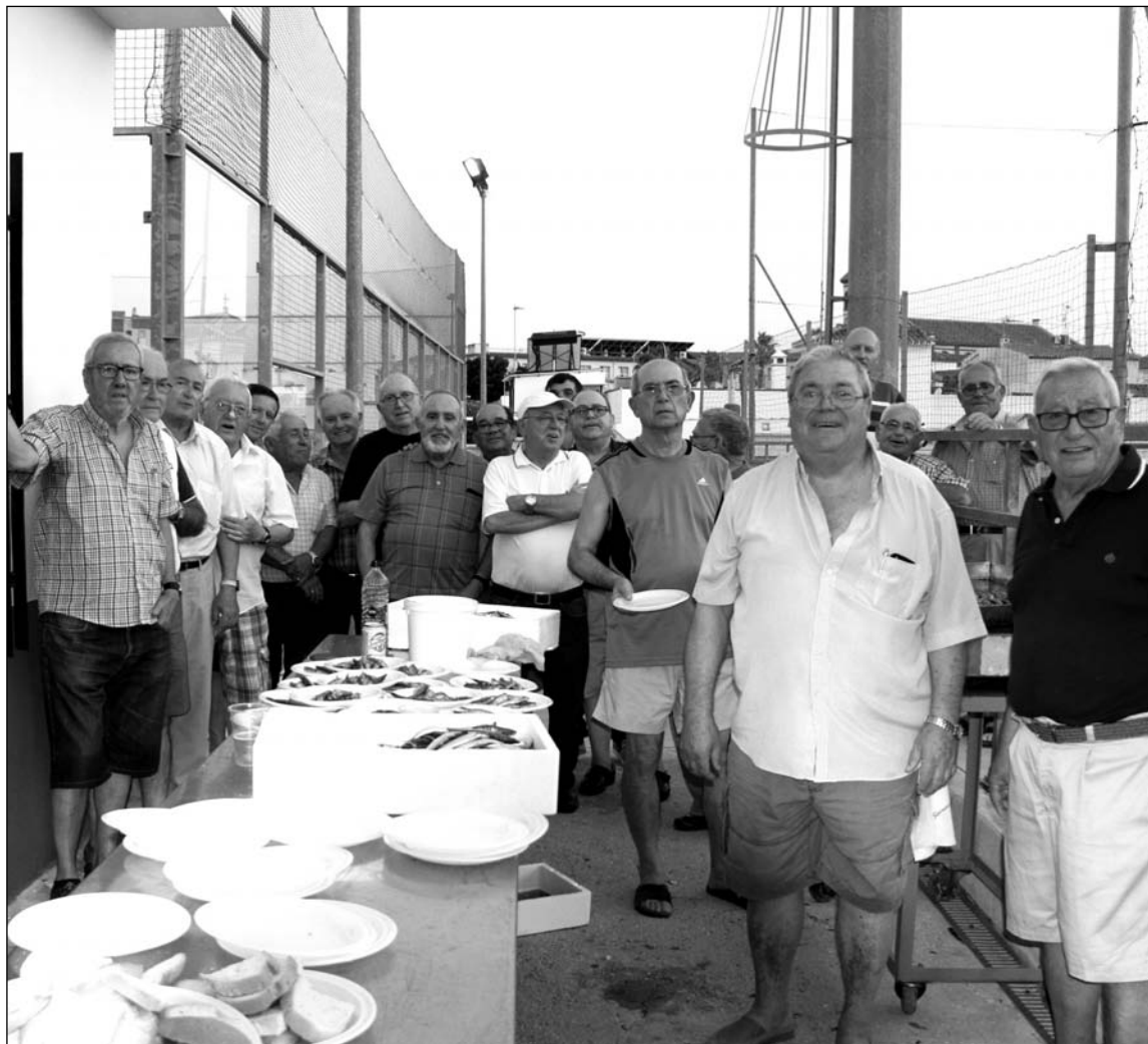
Preparativos de las sardinas por parte de los socios de la Peña El Seis Doble.