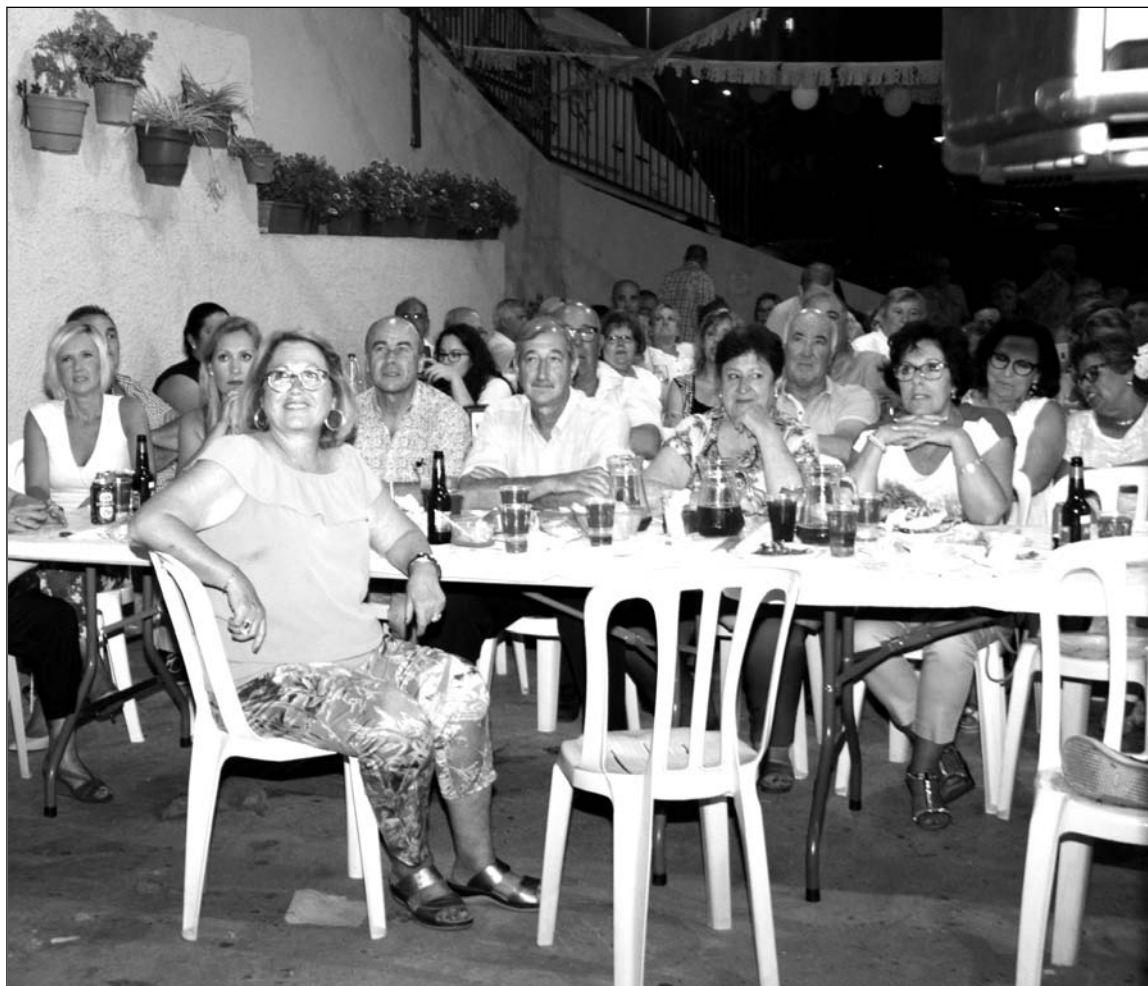
Público asistente a la verbena, disfrutando del recital de copla.