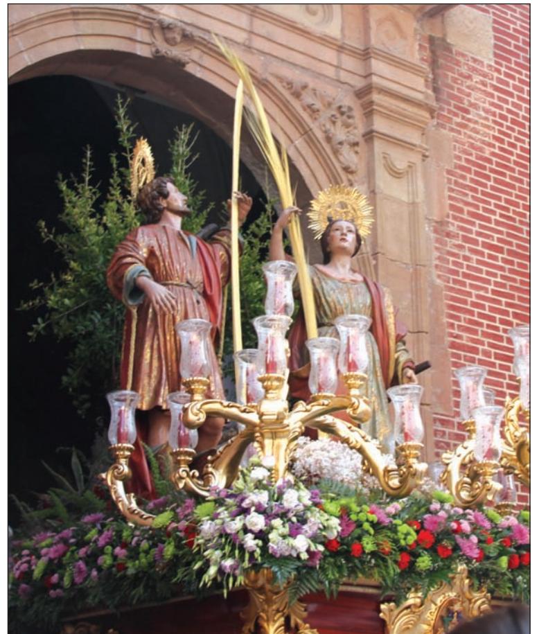
Salida del trono de los Mártires, que este año estrenaba arbotantes.