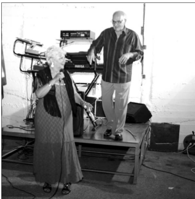
Se contó con música en directo para amenizar la veladilla.