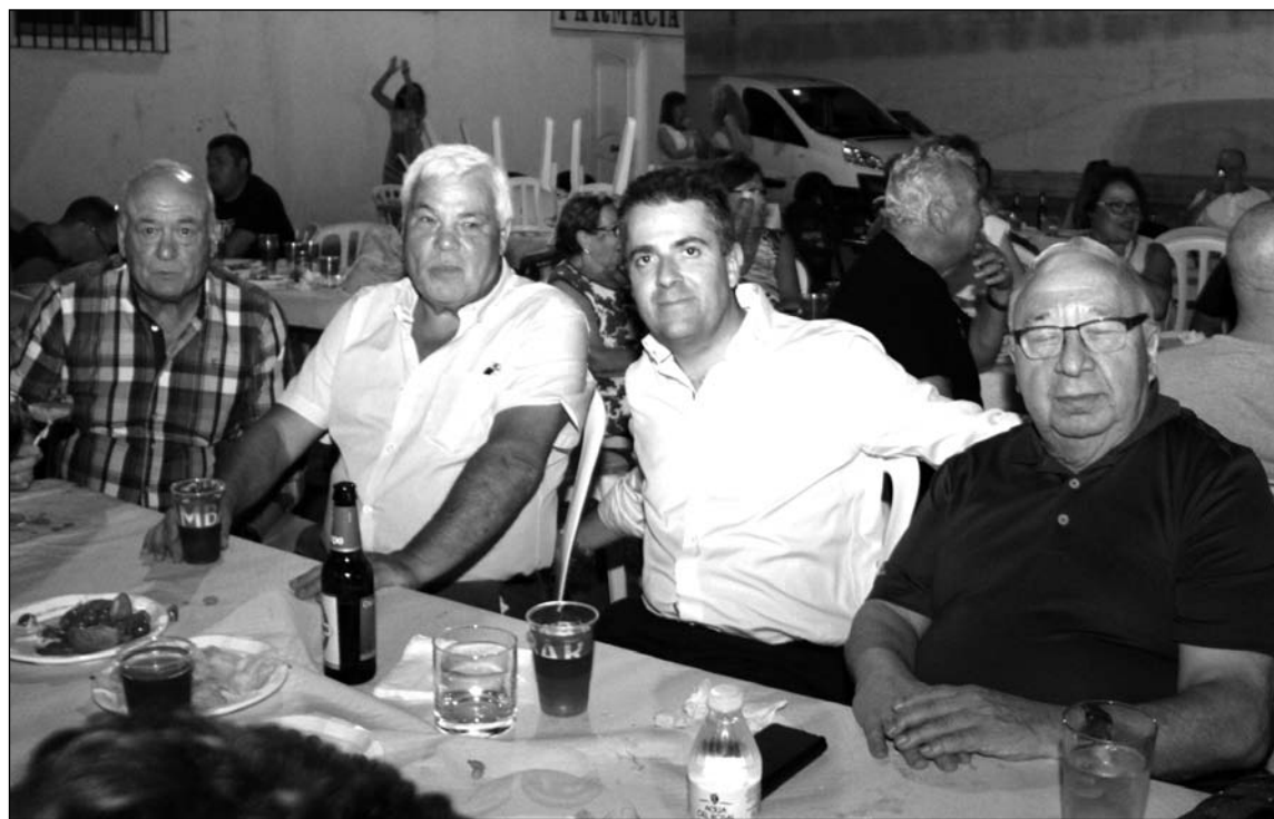
El presidente de la entidad, segundo por la izquierda, con los representantes municipales y del colectivo peñista.