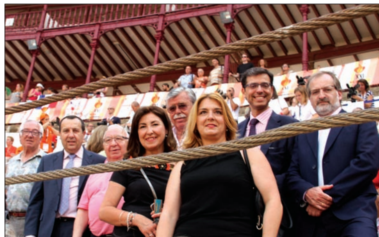
Representantes de la Federación con algunas de las autoridades asistentes.