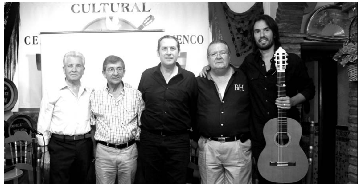
Participantes de la conferencia con directivos de la entidad.

Comenzó el conferenciante hablando de las Tarantas, e hizo una amplia exposición sobre ellas y como base de otros cantes como, Minerías, Cartageneras, Levanticas, Tarantos y Fan-