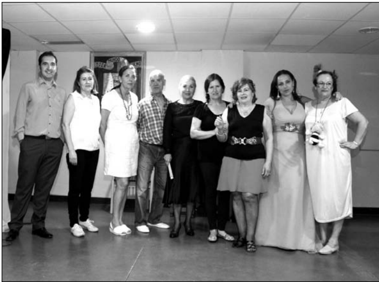
Participantes en esta actividad.