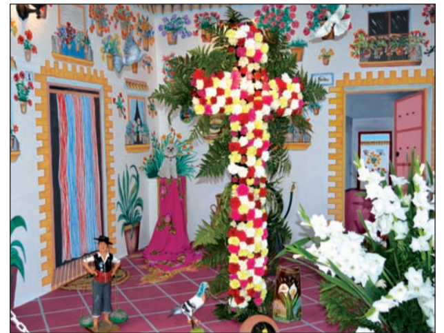
Peña Colonia Santa Inés.