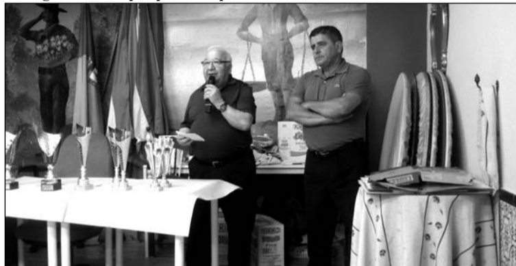
Intervención del presidente en presencia del presidente de la entidad.