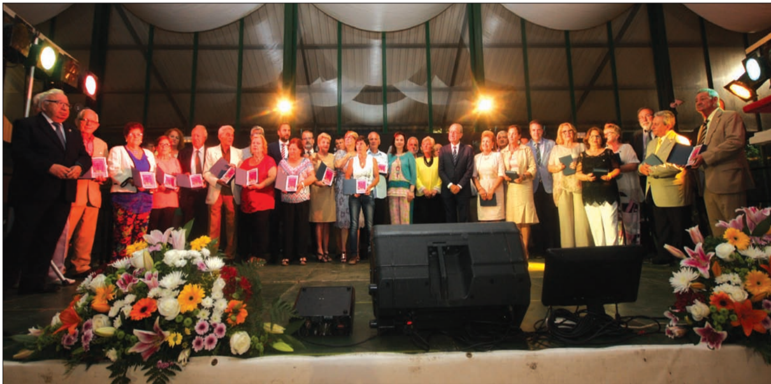
Autoridades y representantes de las entidades participantes en el acto celebrado el pasado sábado 10 de junio en la Finca La Cónsula.

Número 627 14 de Junio de 2017 C/ Pedro Molina, 1 Tfno: 952 22 54 39 Fax: 952 21 48 82 E-mail: prensa@femape.com - la_alcazaba@hotmail.com Web: www.femape.com Edición digital: www.femape.com/laalcazabadigital Twitter: @FMPLaAlcazaba Facebook: www.facebook.com/FMPLaAlcazaba