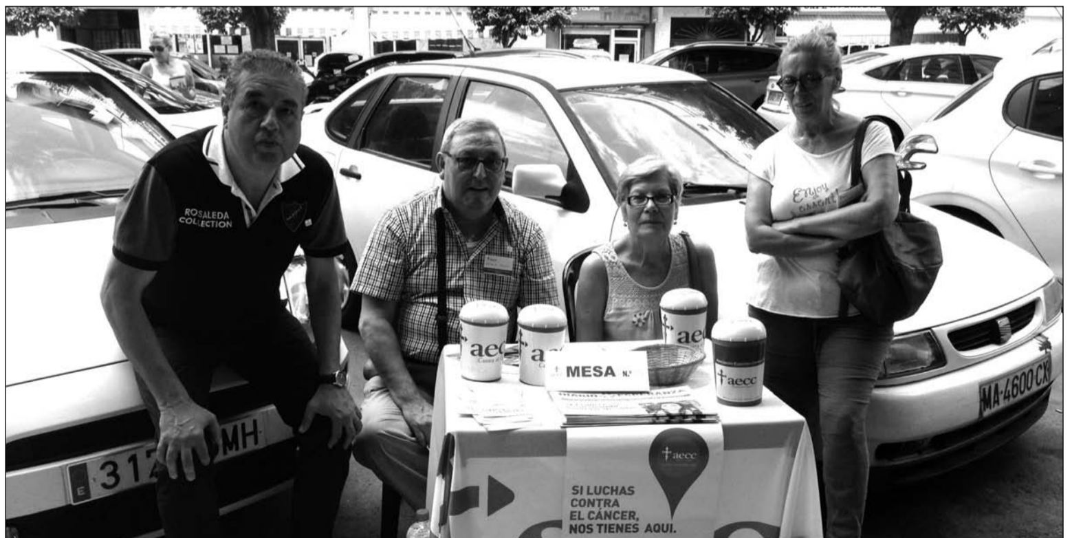
Voluntarios de la Peña La Solera.

La Peña La Solera se ha unido un año más para colaborar con la Asociación Española Contra el Cáncer con la instalación de una mesa petitoria en la calle. De este modo, su presidente y diferentes componentes de esta entidad federada se ofrecieron voluntarios para la instalación de una de las 2.500 mesas que se han montado en todo el país con el objetivo de recaudar fondos, así como informar sobre sus actividades, programas y servicios; además de concienciar sobre hábitos de vida saludables y acercar la realidad de los pacientes de cáncer a la población.