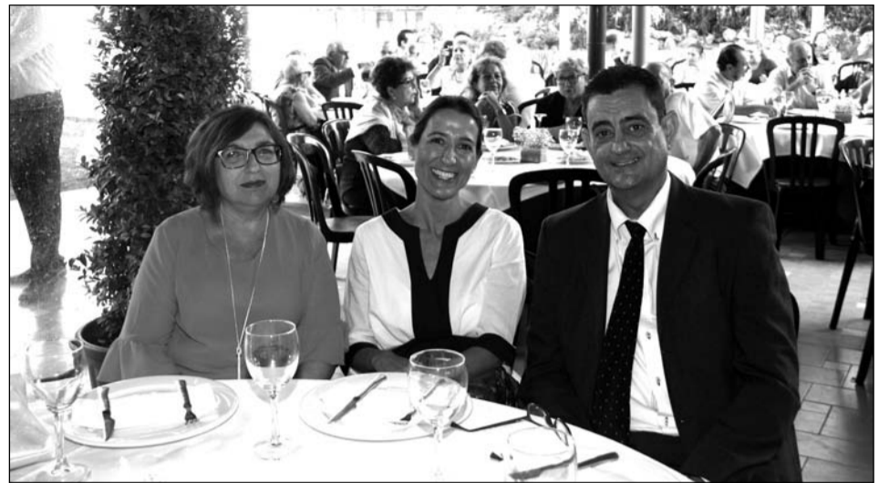
Componentes del jurado del XXVII Certamen de Cruces de Mayo.