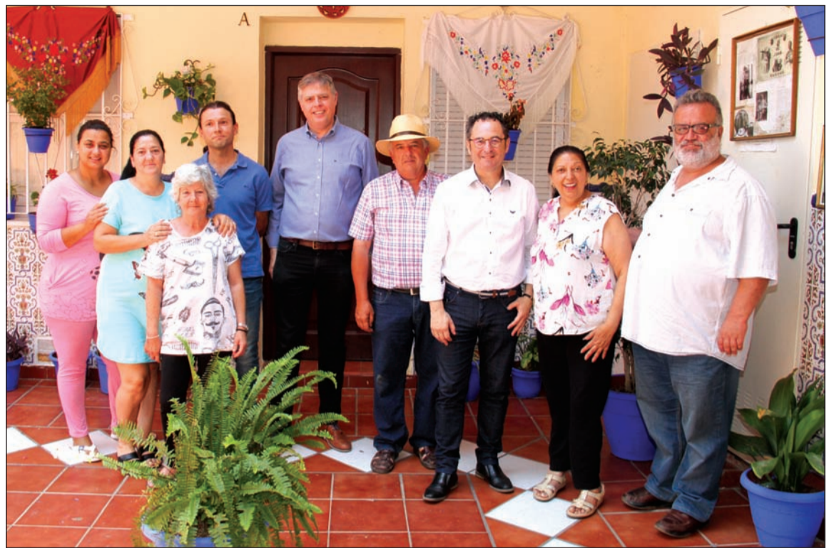
El director del distrito Centro y otros responsables municipales, con vecinos de uno de los corralones.

La gala final de clausura de esta XI Semana de los Corralones de Trinidad Perchel fue un acto festivo con veladilla popular y entrega de premios a los ganadores del Concurso de Engalanamiento de los Corralones; así como numerosas actuaciones en el Corralón de Santa Sofía.