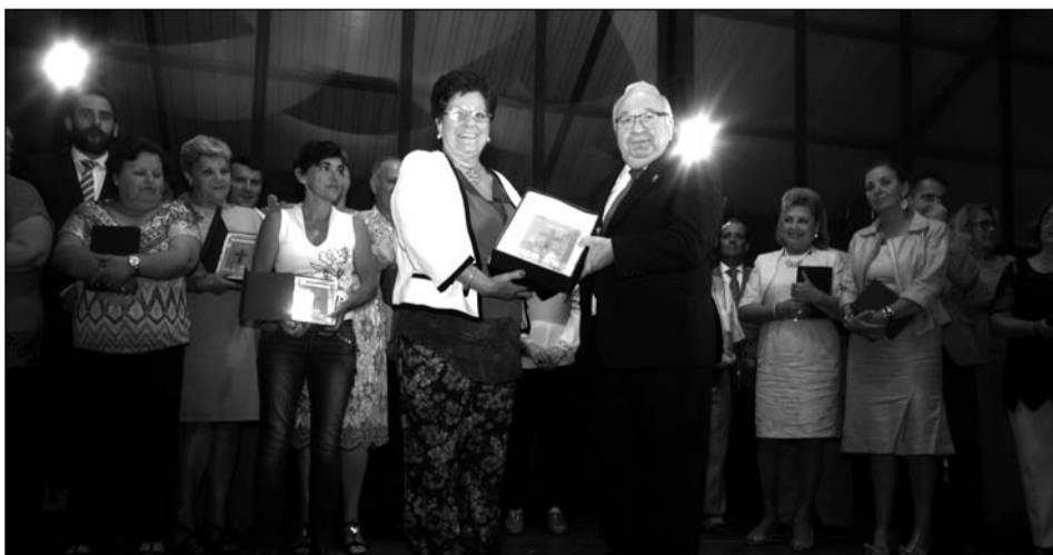
Entrega del segundo premio.