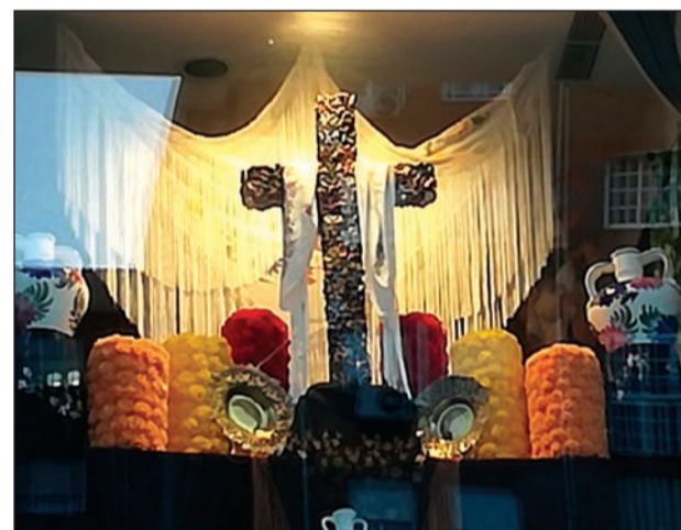
Asociación de Vecinos Zona Europa.

Hay cosas que son exclusivamente malagueñas