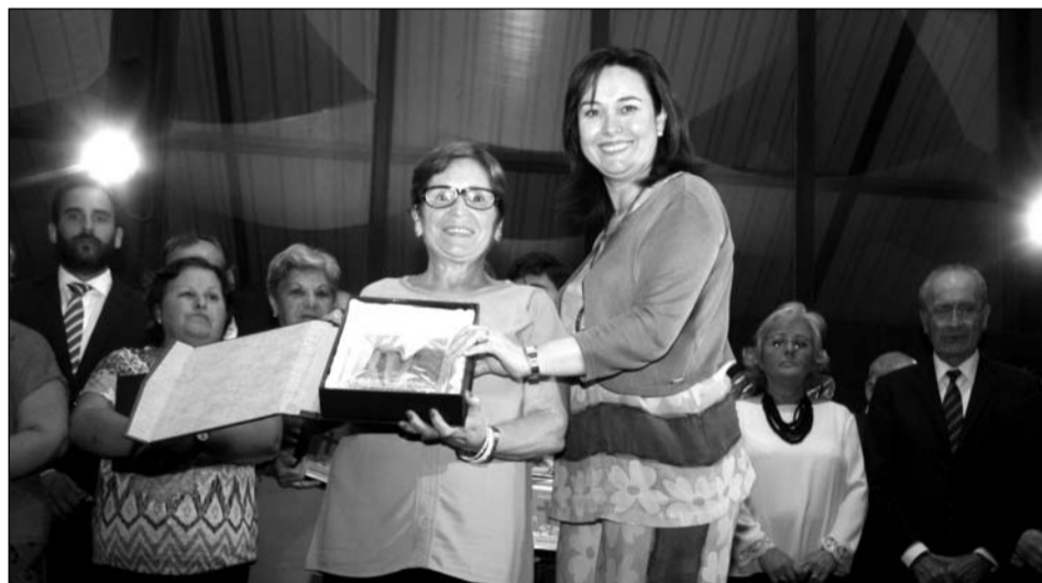
Premio a la Cruz Más Tradicional.