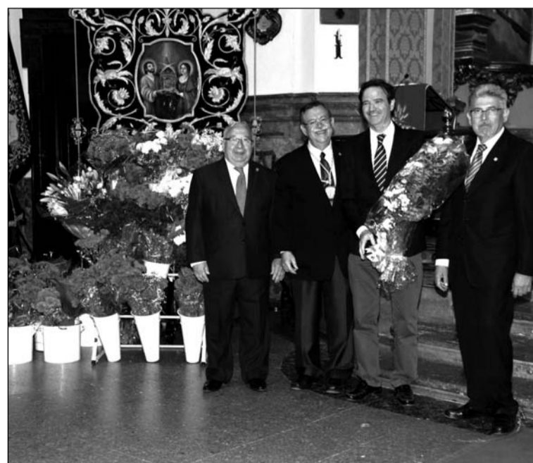
Imagen de la ofrenda floral del pasado año.

Esa tarde, a las 19:30 horas, se iniciará la Solemne Procepción Triunfal de San Ciriaco y Santa Paula Patronos de Málaga.