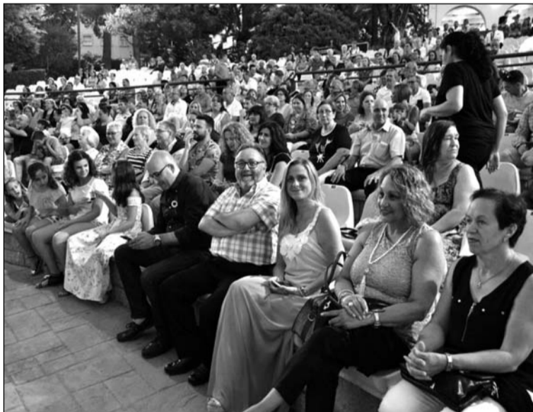
Aspecto que presentaba la Finca El Portón.