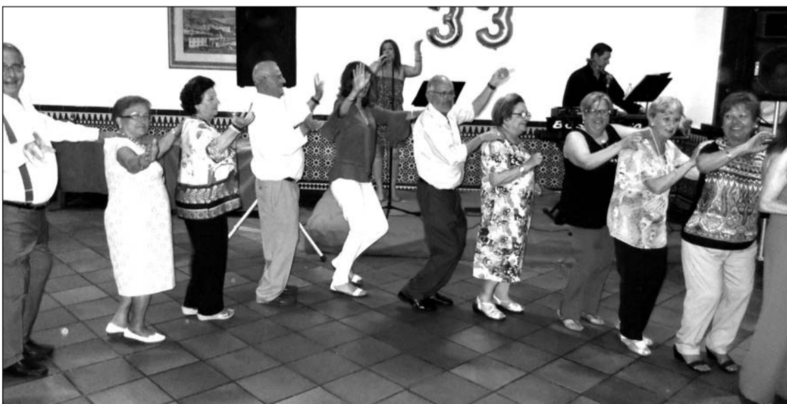
Socios bailan al son de la música de la orquesta.