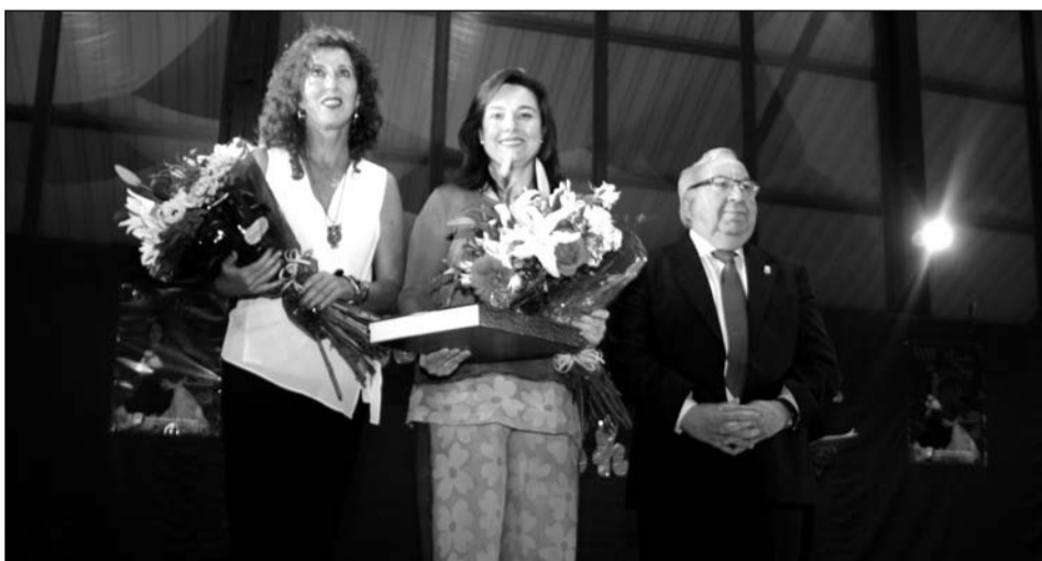
Agradecimiento al Distrito 8 de Churriana.