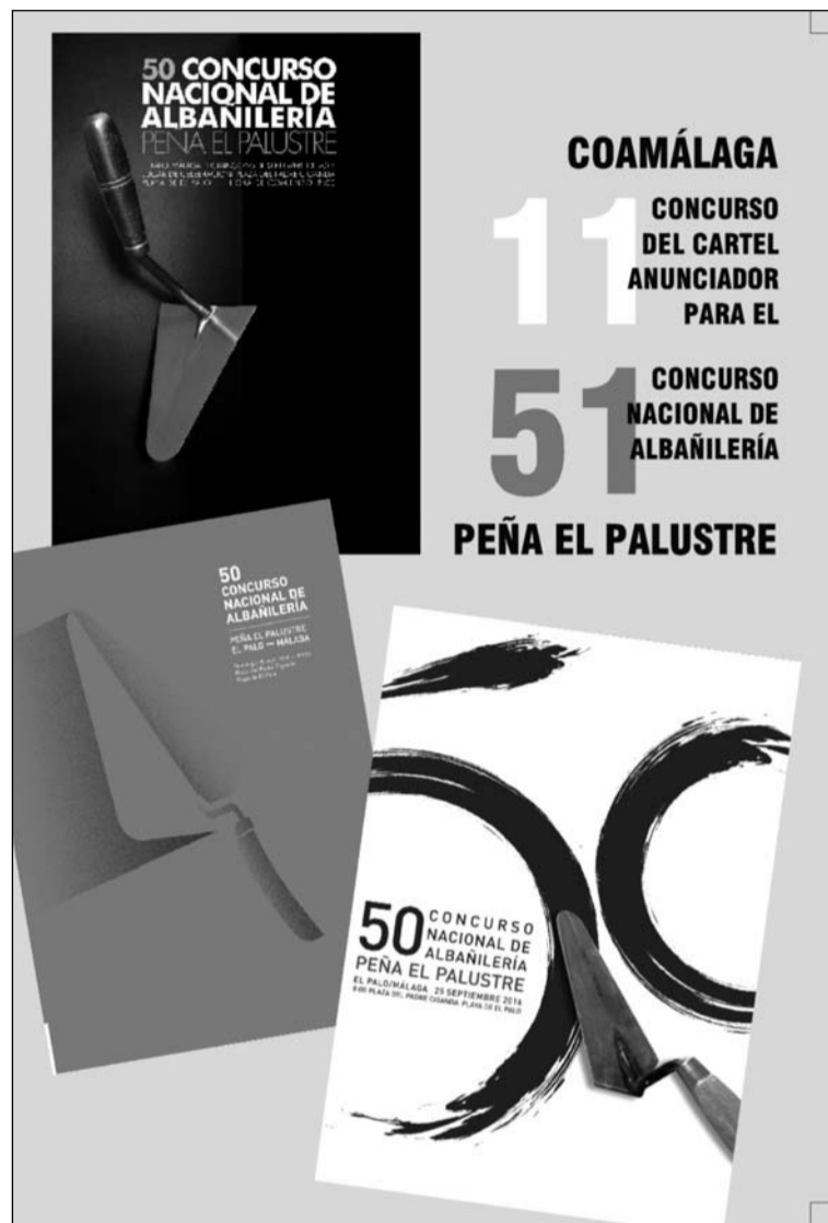
Cartel del concurso.

Las obras seleccionadas como finalistas se expondrán en la sede del Colegio de Arquitectos de Málaga del 30 de junio al 14 de julio, y en los salones de la Peña el Palustre entre el 1 y el 21 de septiembre. Todas las obras presentadas se expondrán en las instalaciones del centro de enseñanza SAFA-ICET,