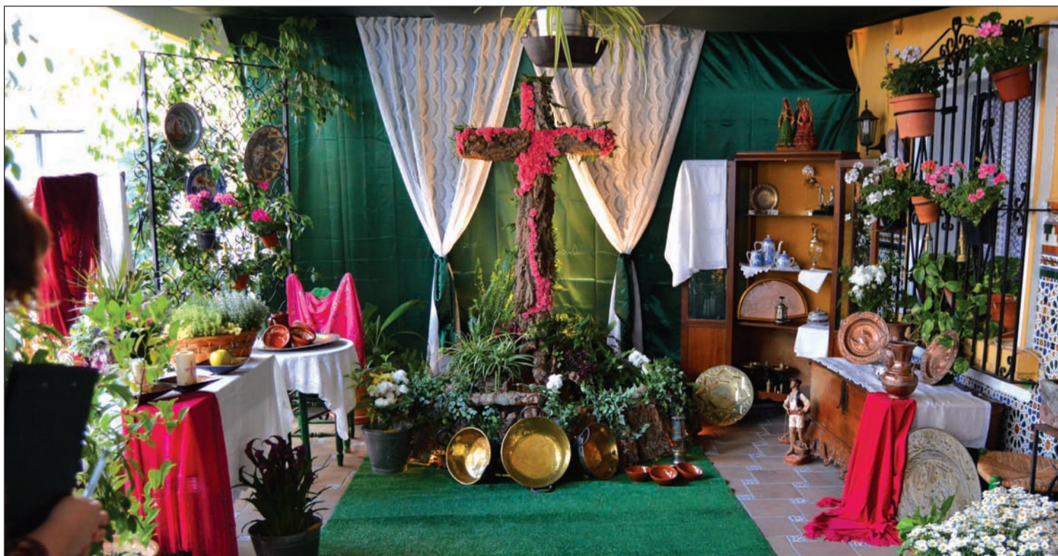
Cruz de Mayo de la Peña El Sombrero, primer premio en el XXVII Certamen 'Memorial José María Martín Carpena'.