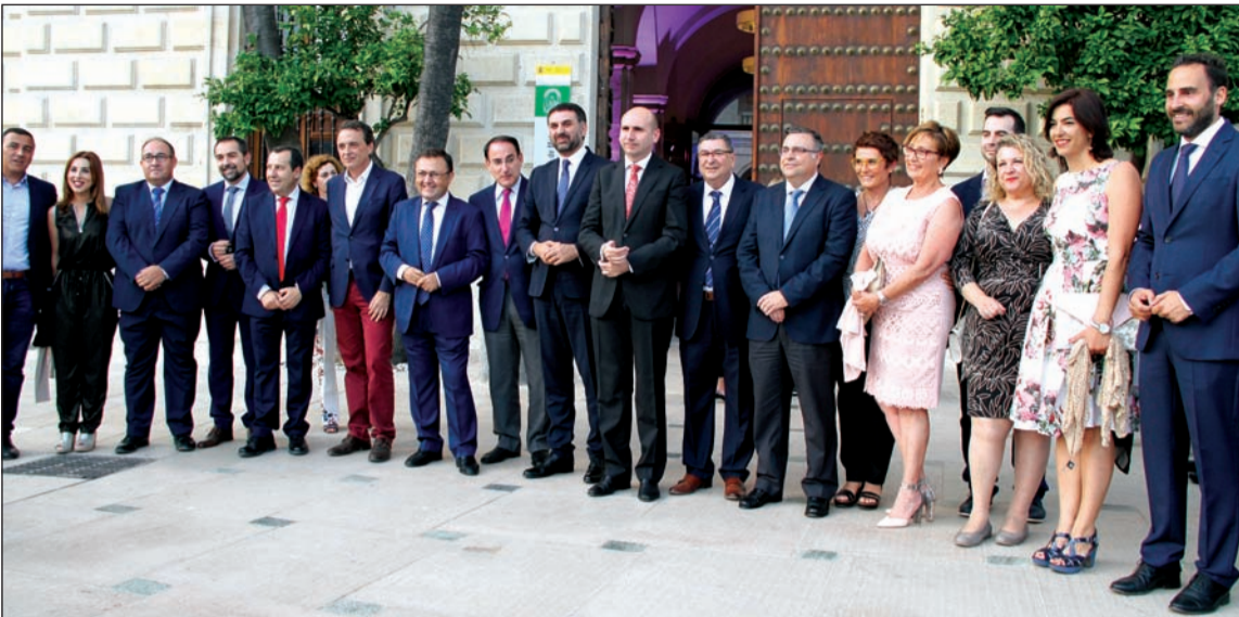
Autoridades en el exterior del Palacio de la Aduana.