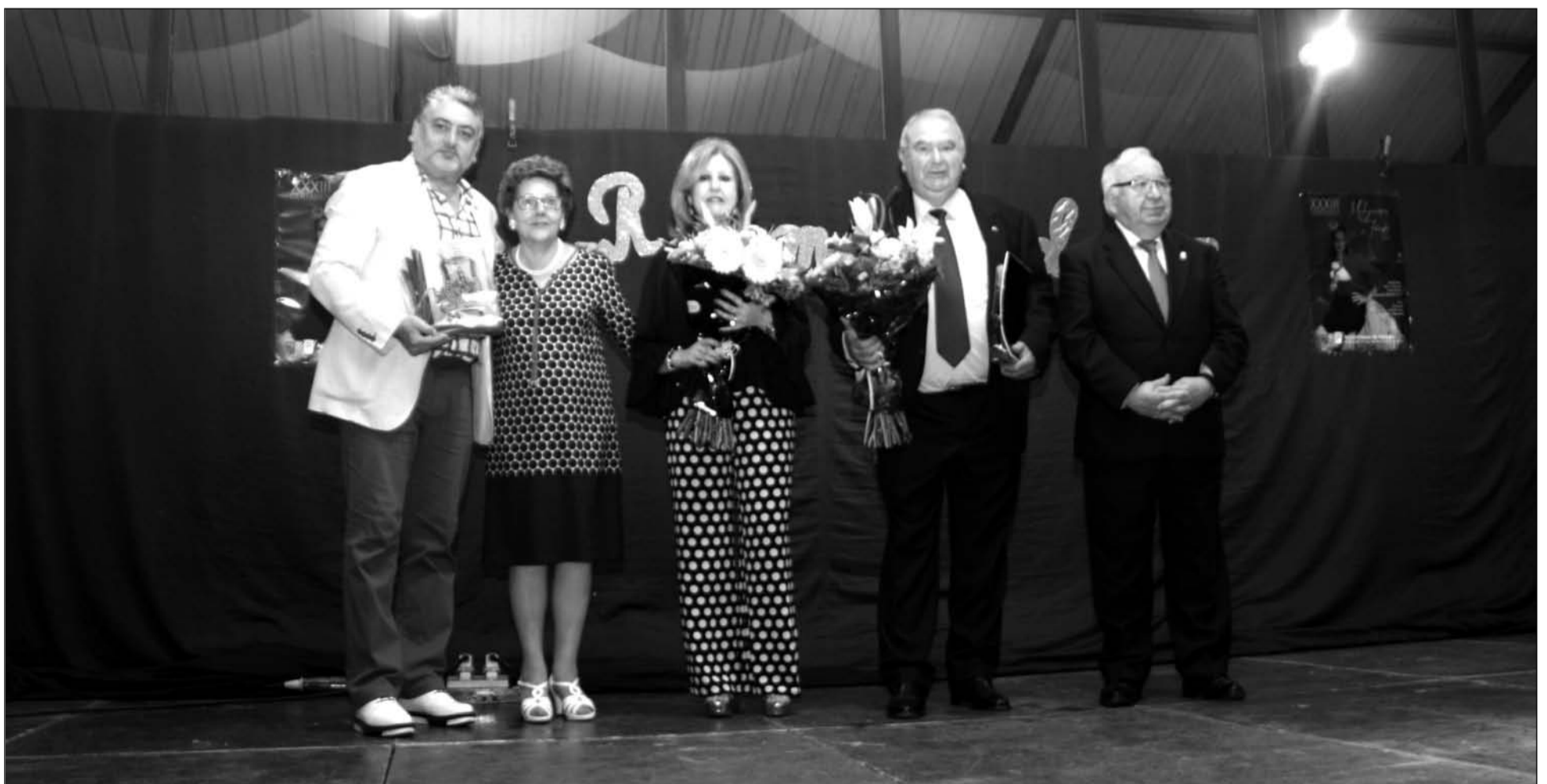
Entrega de agradecimientos tras el pregón.