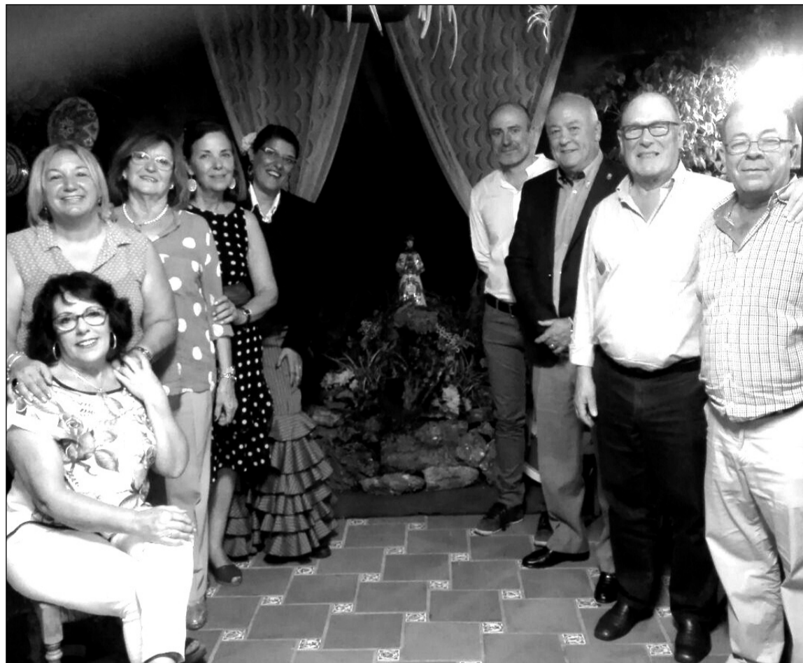
Se instaló un pequeño altar dedicado a la Virgen del Rocío.