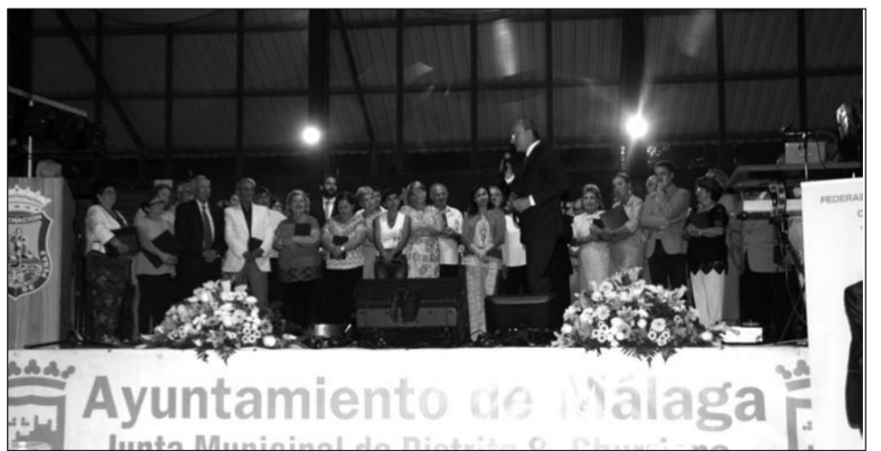
El alcalde fue el encargado de cerrar el acto.