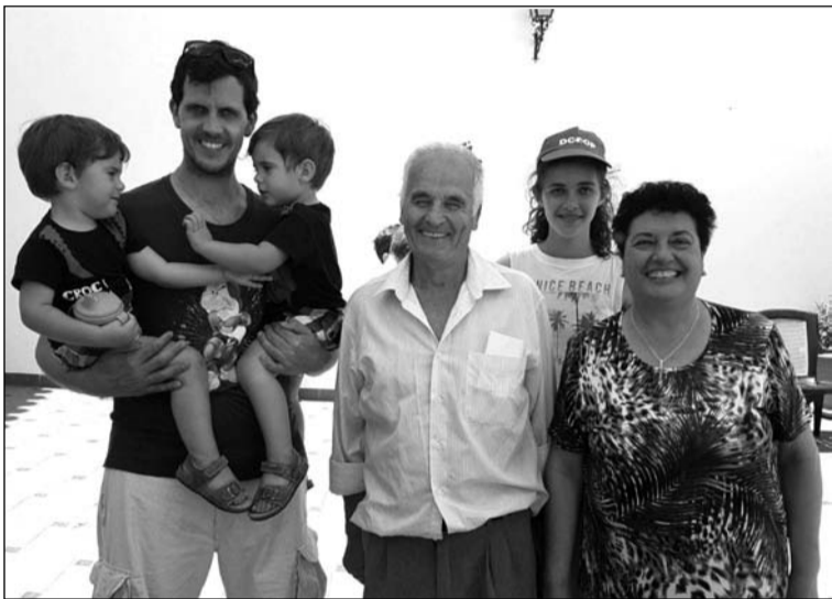
Participantes tras la entrega de trofeos.