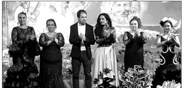
Participantes en la semifinal del Concurso de Copla de Rincón de la Victoria.