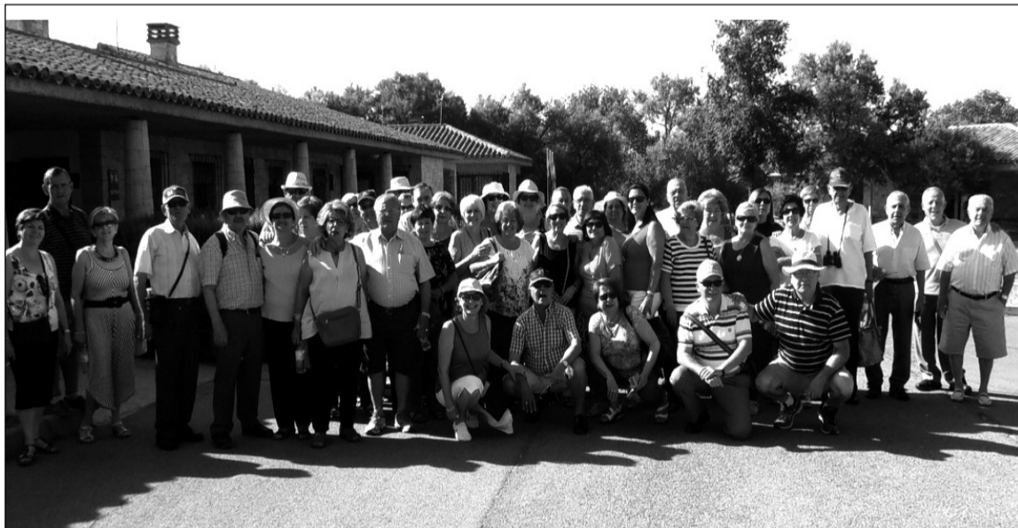
Grupo de socios de la asociación durante su visita a La Mancha.

En total han sido alrededor de 50 personas las que han vivido unos agradables días de convivencia entre vecinos que han valido para conocerse mejor y cumplir de este modo con los objetivos marcados por esta Asociación de Vecinos Zona Europa.