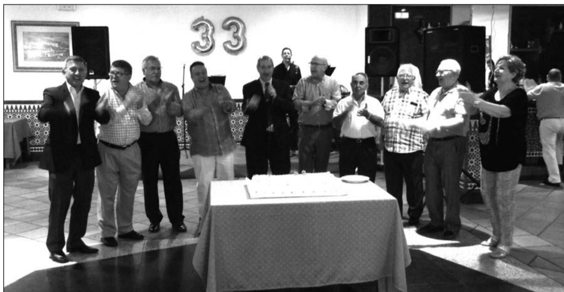
Componentes de la entidad celebran el aniversario.