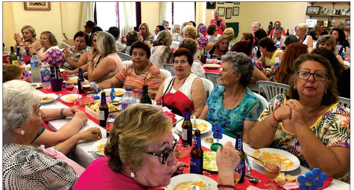
La sede se llenó de peñistas para disfrutarde esta actividad.