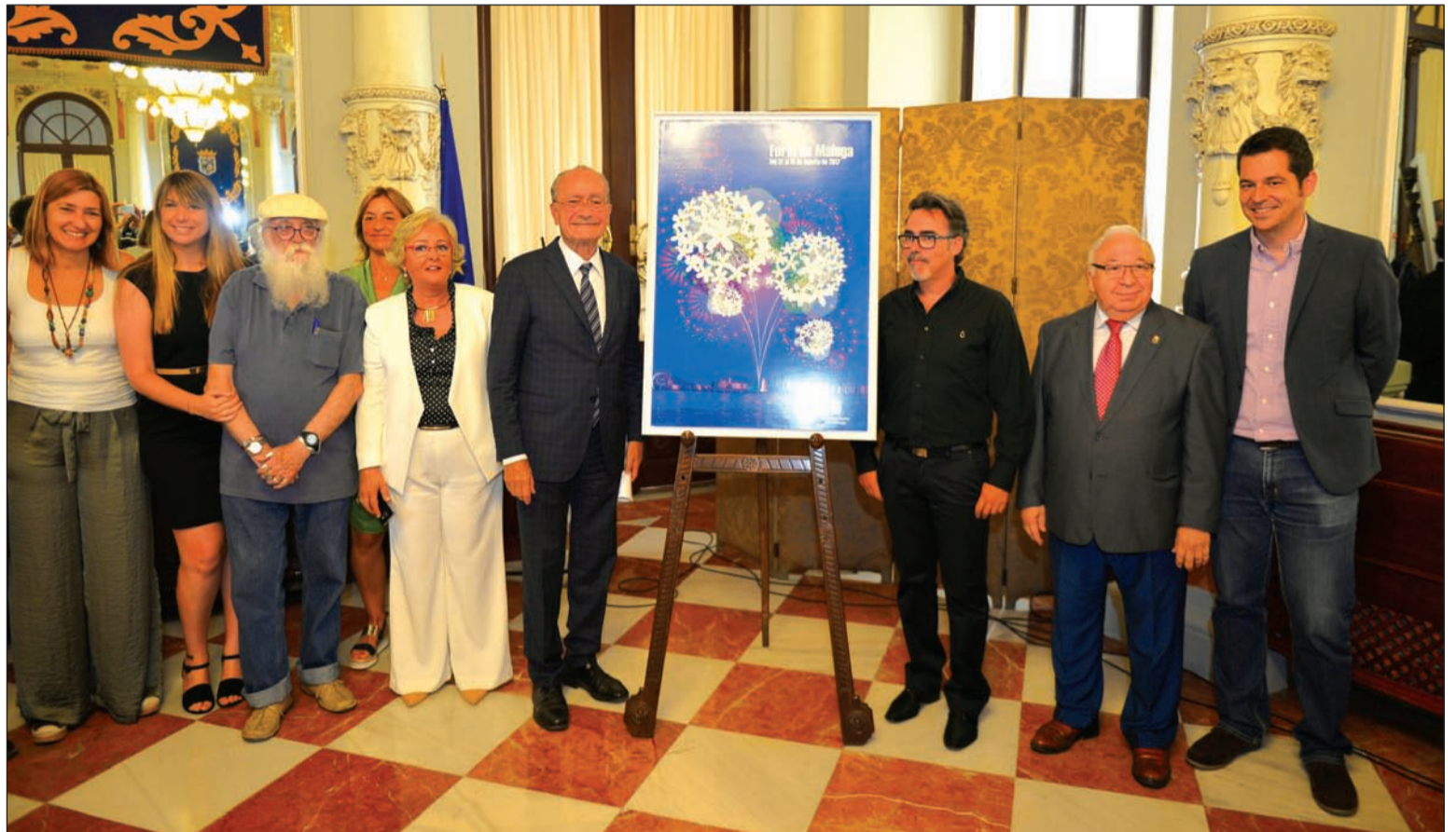
Acto de presentación oficial del cartel de la Feria de Málaga 2017, realizado en el Salón de los Espejos del Ayuntamiento de Málaga.