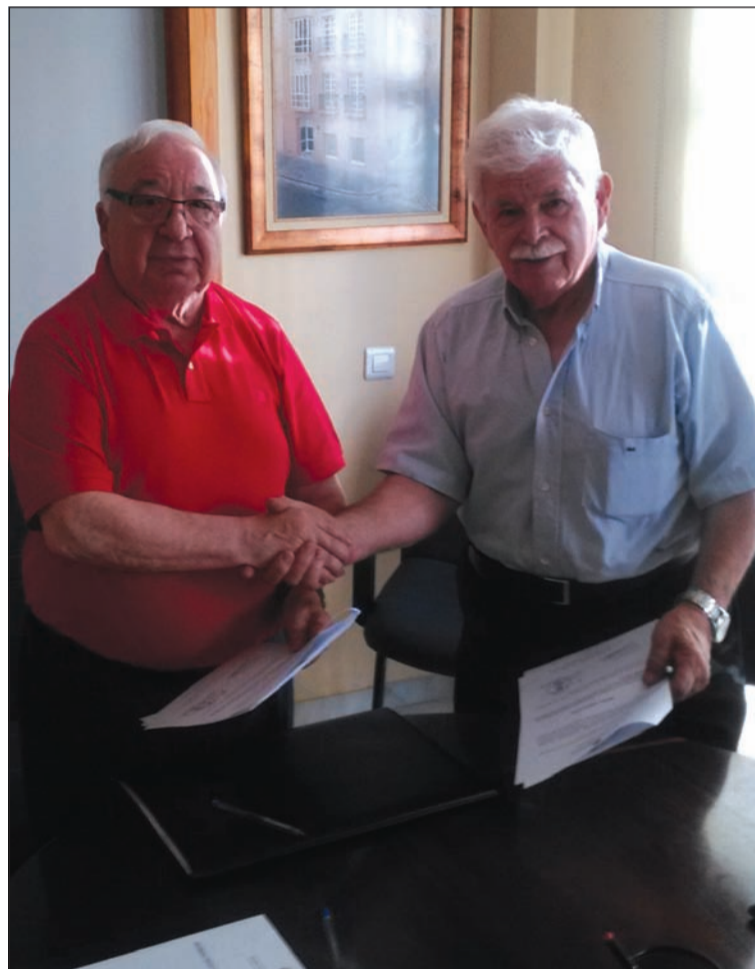
El presidente de la Federación con el propietario de Neumáticos San Martín.

Entidades colaboradoras con esta publicación: