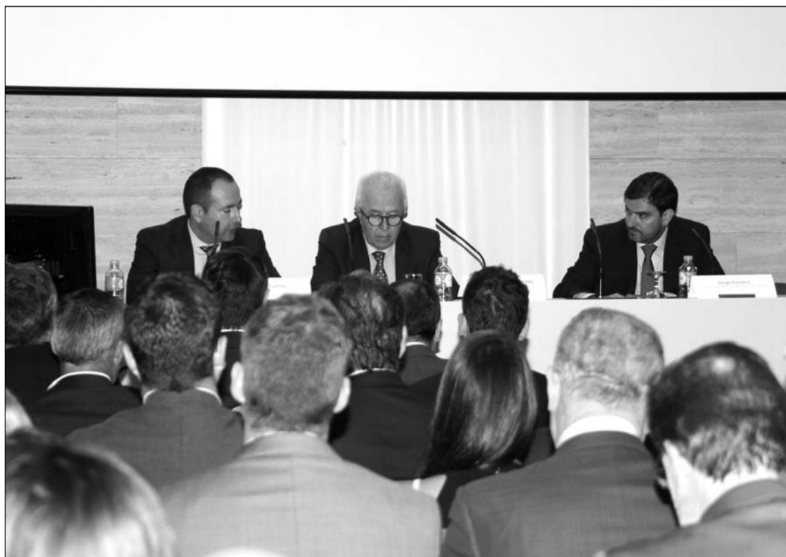
Mesa de debate sobre 'Innovación y distribución minorista'.