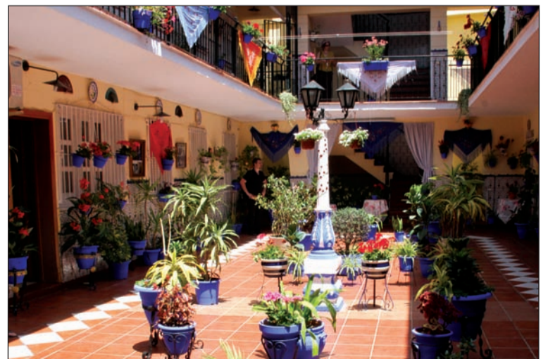
Los vecinos han decorado especialmente sus patios.

COMPLICARSE LA VIDA ES MARAVILLOSO UNA NUEVA GAMA DE MIXERS CON MÁS DE CUARENTA MATICES Y SABORES COMPLEJOS