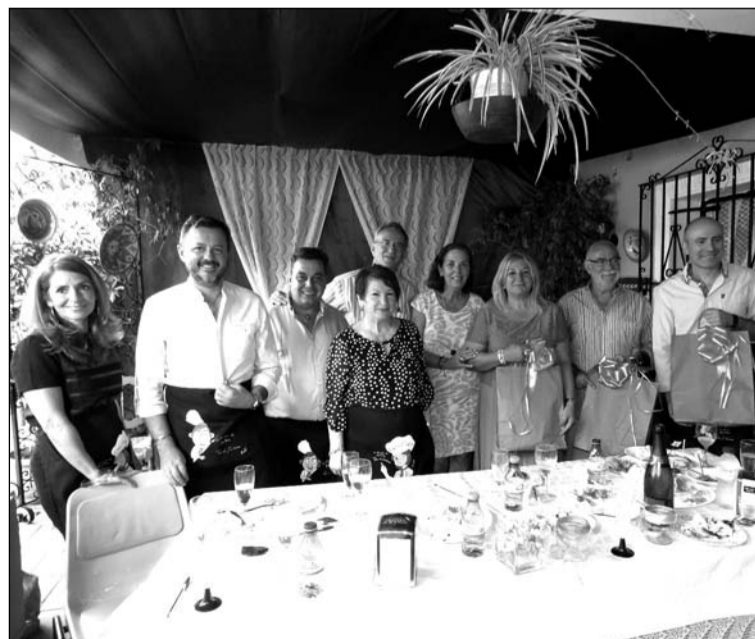
Miembros del jurado con representantes de la peña y los vencedores del concurso.