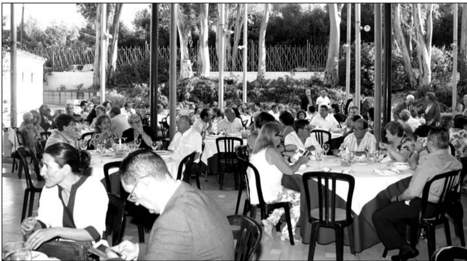
Aspecto que presentaba la Finca La Cónsula.