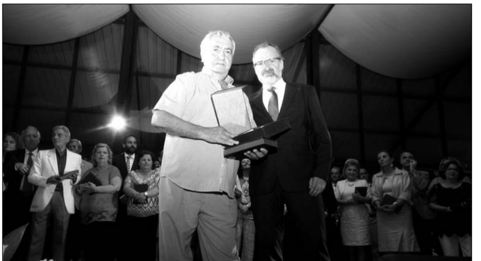
Entrega del tercer premio.