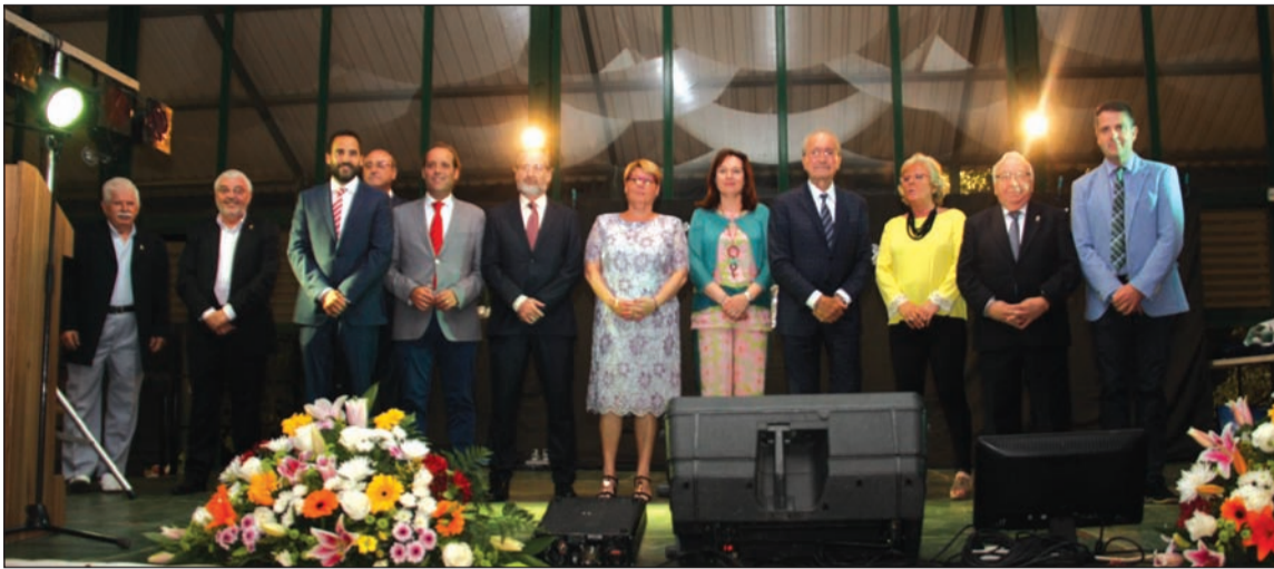
Autoridades y patrocinadores, con el presidente de la Federación Malagueña de Peñas.