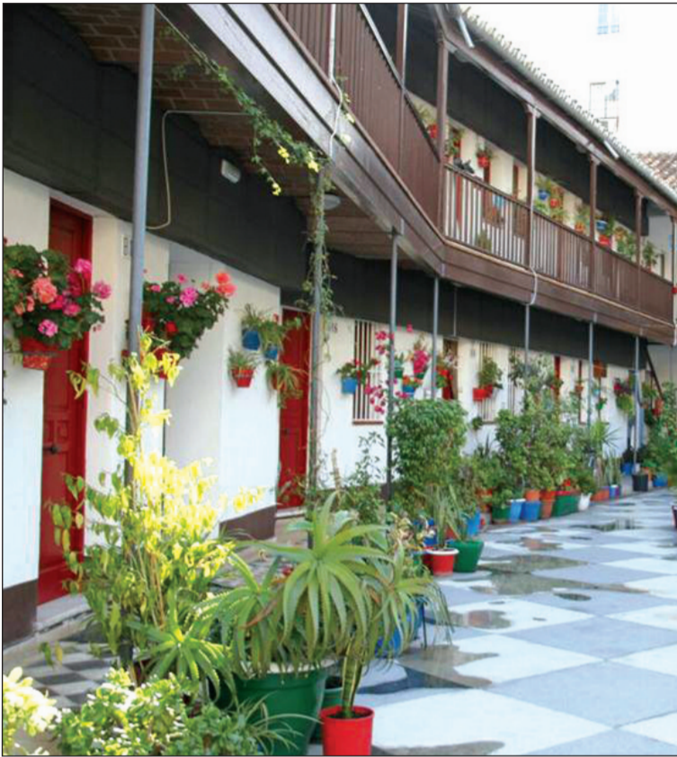
Vista del Corralón de Santa Sofía.

cripciones demuestran un mantenimiento de la participación de los patios de los corralones con relación a la edición anterior.