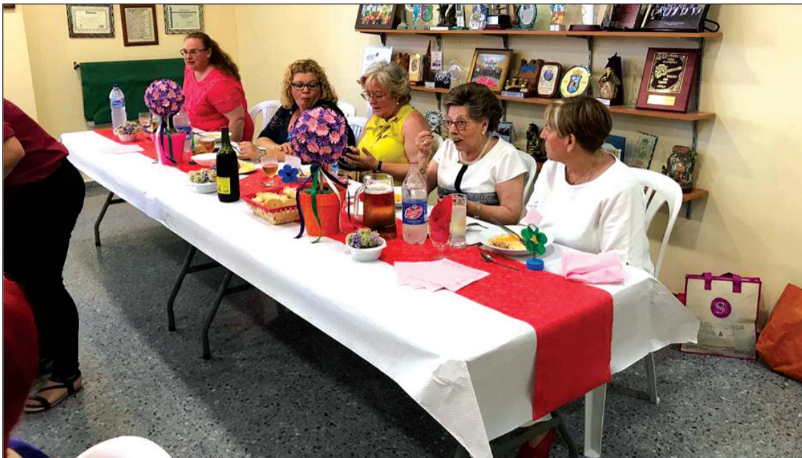
Carta remitida por el alcalde al presidente de la Federación por su reelección.

◆ Federación Malagueña de Peñas, Centros Culturales y Casas Regionales 'La Alcazaba'