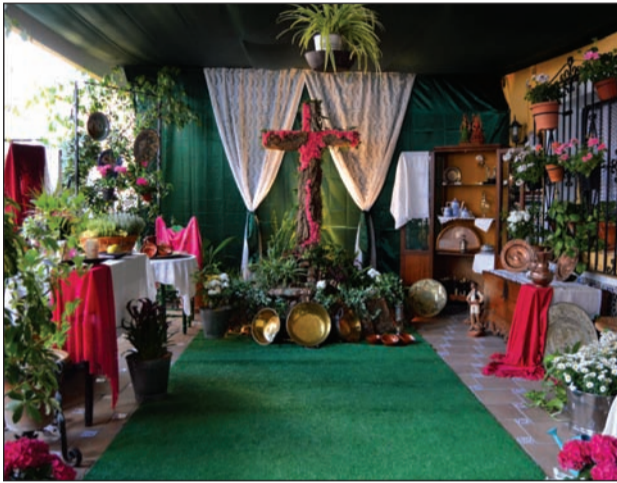
Peña El Sombrero.