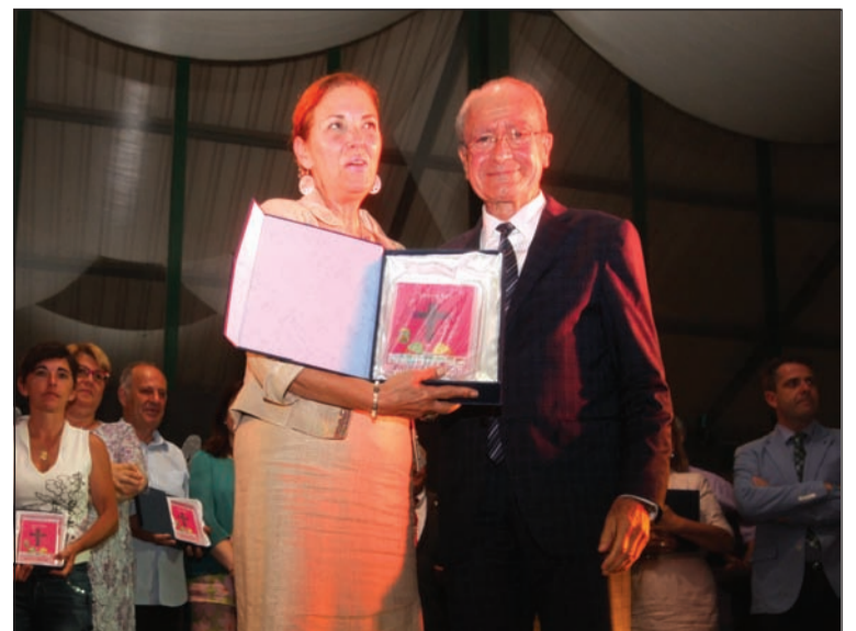
La presidenta de la Peña El Sombrero recibe de manos del alcalde el premio.