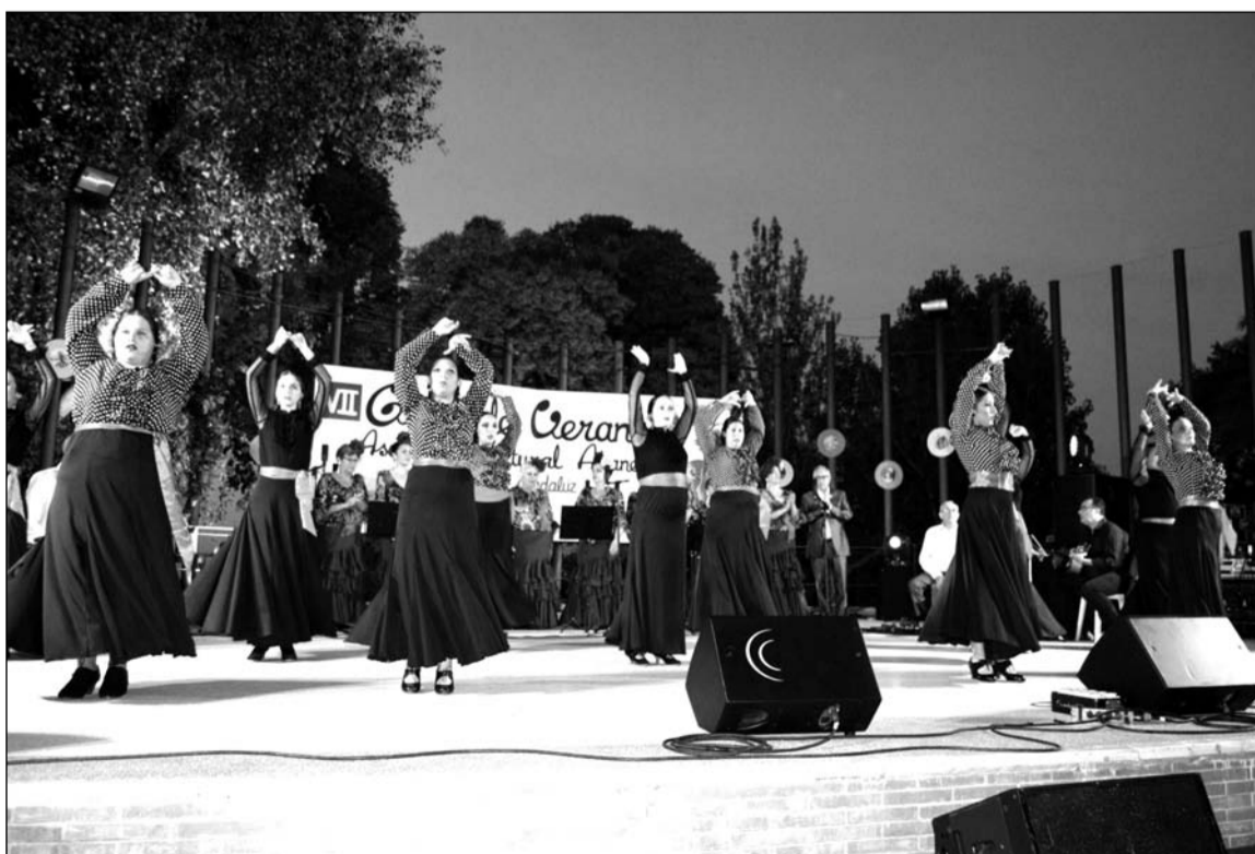
Uno de los grupos participantes en el espectáculo.