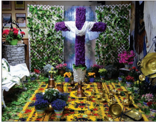
Centro Cultural Renfe.