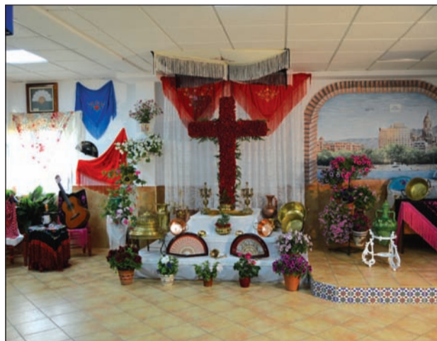
Peña Montesol Las Barrancas.