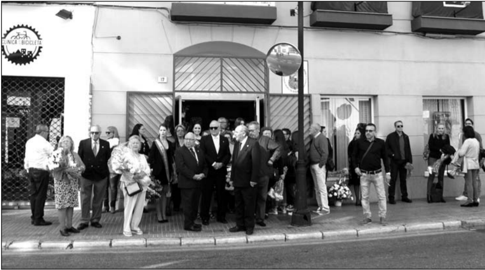
Los peñistas quedaron en la sede de la Federación.