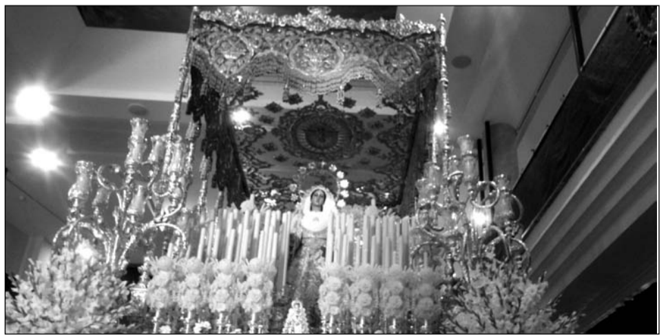
María Santísima del Rocío Coronada.