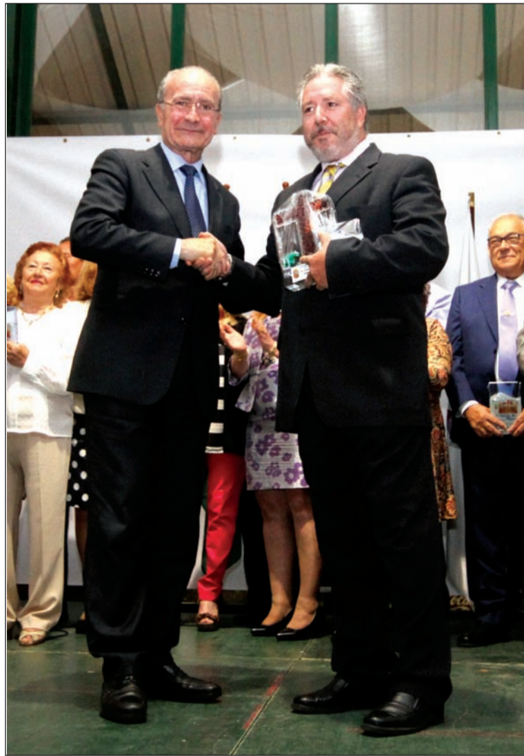
El alcalde entrega el premio al presidente de la entidad ganadora en 2016.

La entrega de premios se efectuará el sábado día 27 de mayo a las 20:30 horas en la Finca La Cónsula (Churriana). Así, se entregarán trofeos a los tres primeros clasificados, además de un Premio Especial del Jurado y otro a la Cruz Más