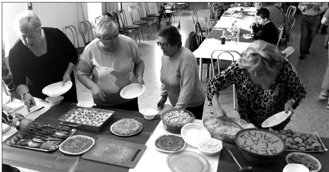
Los socios llevaron platos de su casa para compartir.