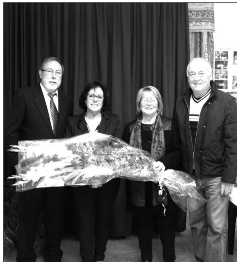
Ramo de flores que fue ofrecido al Cristo de la Expiración.

La visita continuaba por la ciudad de Granada, donde los socios y amigos de la peña disfrutaron de sus monumentos y de su gastronomía.