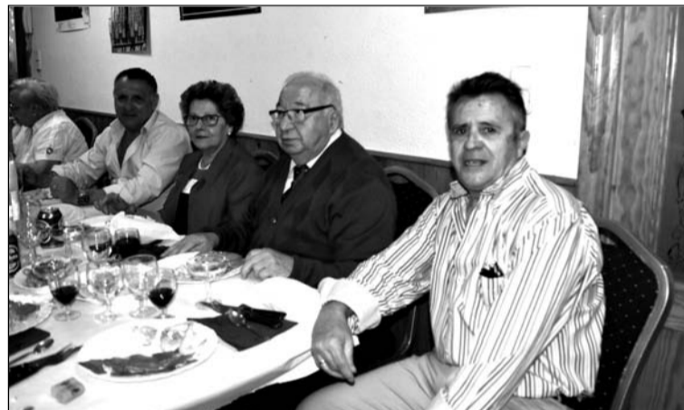
Un instante del almuerzo en la Peña El Parral.

Entre los asistentes se encontraba el presidente de la Federación Malagueña de Peñas, Centros Culturales y Casas Regionales 'La Alcazaba', que brindaba con los componentes de esta entidad.