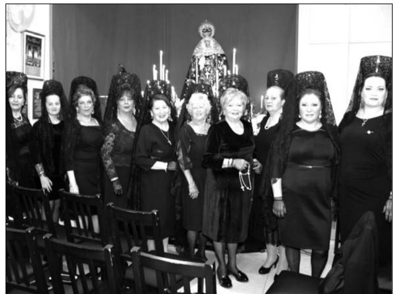
Mantillas ante la Virgen que presidía el escenario.