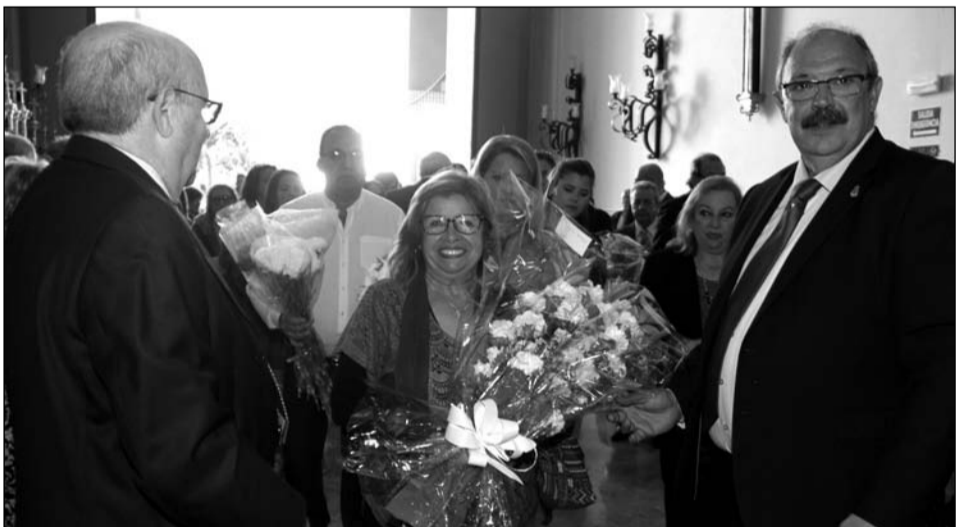
Numerosas entidades se sumaron a la ofrenda.