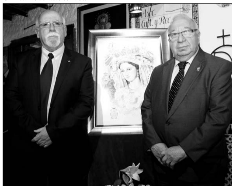
Los presidentes de la asociación y la Federación de Peñas.