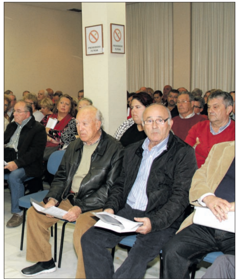
Asistentes a la asamblea celebrada con anterioridad,