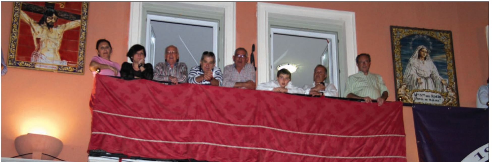
El Hotel Tribuna engalanó su fachada para la Semana Santa

o hermandad es soberana de hacer su estación de penitencia como decidan sus hermanos, únicamente con el objetivo de recuperar y potenciar nuestro patrimonio y acervo cultural, la Federación Malagueña de Peñas, Centros Culturales y Casas Regionales se ofrecía a dedicar una Saeta al paso de los Sagrados Titulares de todas las hermandades que discurren por