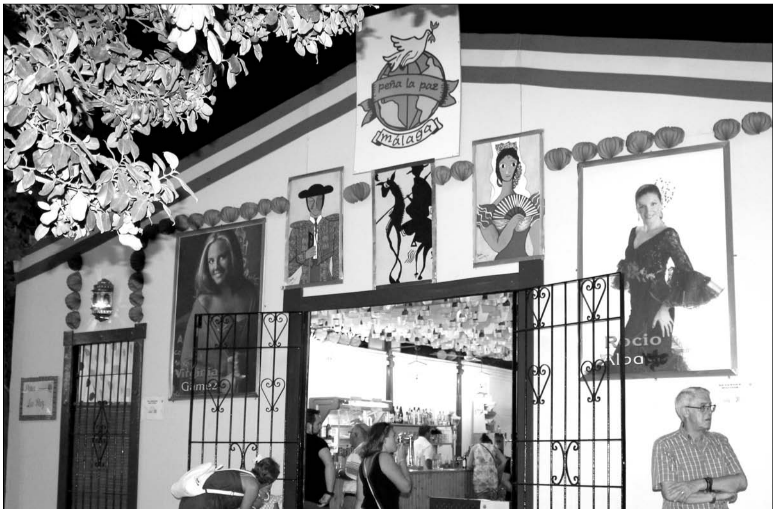
Fachada de una de las casetas instaladas en el recinto ferial de Cortijo de Torres.