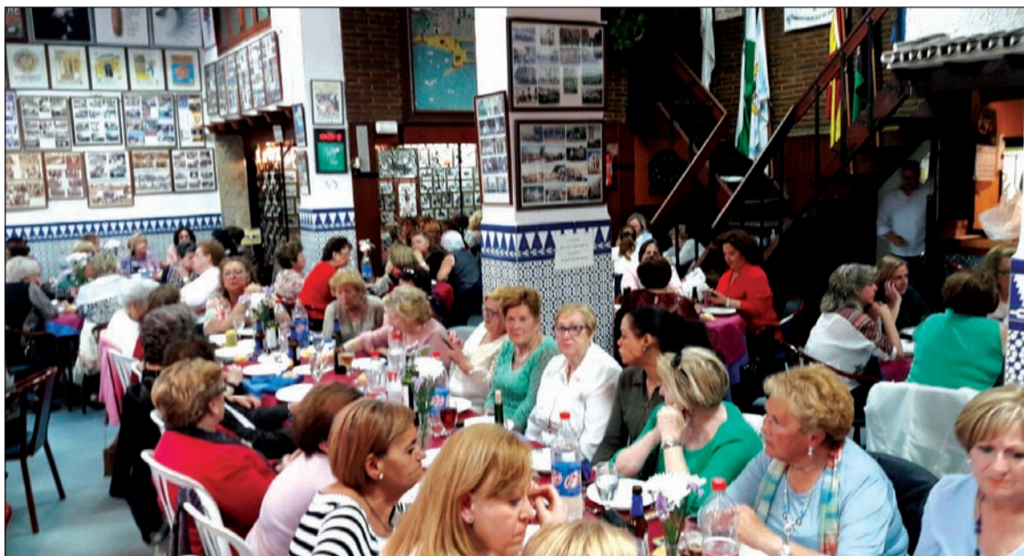
Vista general del salón de la entidad durante la comida.