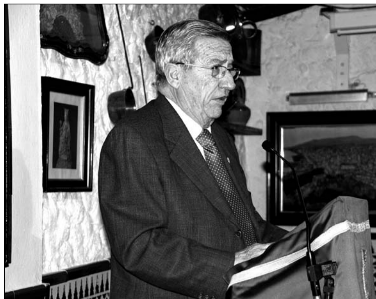
Un instante del acto cofrade.