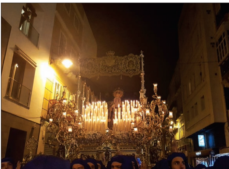
La Virgen de la Concepción fue otra de las Imágenes a las que se le cantó.