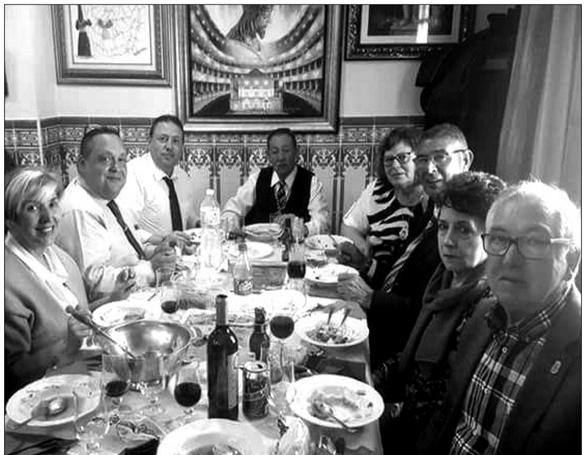
Imagen de la comida ofrecida en la Peña Recreativa Trinitaria.