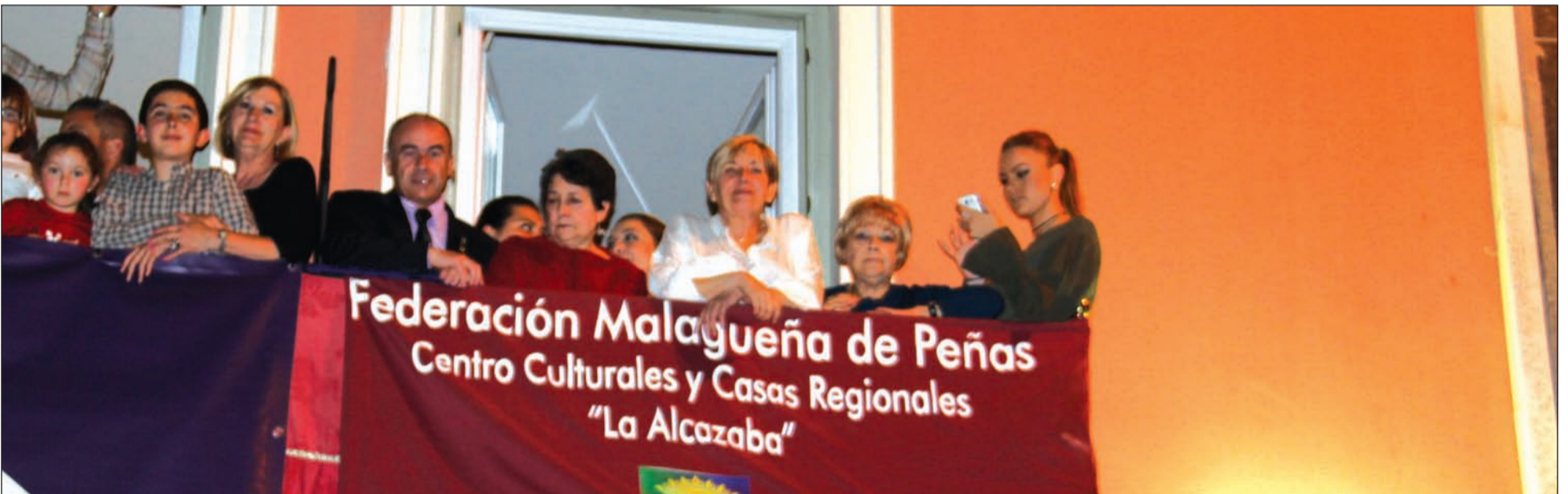
Balcón de la Federación Malagueña de Peñas al paso de una de nuestras cofradías.

Hay cosas que son exclusivamente malagueñas