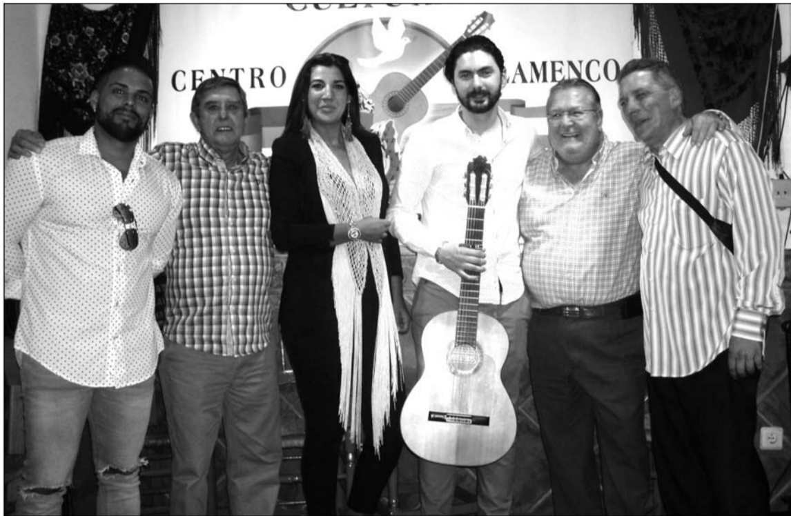
Artistas flamencos con socios de la entidad.

Ella ha prestado su cante, actuando con los mejores cuadros flamencos de España, como Joaquín Cortés o Amargo, por lo que escuela no le falta, y esa voz tan gitana que tiene, te llega a las entrañas, y te ponen los pelos de punta. Estuvo muy bien acompañada con la guitarra de Fran Moya, que en todo momento supo engrandecer con su toque a la cantaora.