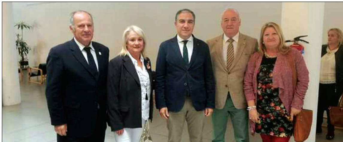
La Federación Malagueña de Peñas participó en la jornada presidida por Elías Bendodo.

Por ejemplo, la Oficina de Intermediación Hipotecaria de la Diputación de Málaga y el Colegio de Abogados ha evitado más de 600 desahucios, y en la actualidad tramita 202 casos de 34 municipios por el conflicto de las cláusulas suelo. De hecho, ya ha empezado a reclamarse a las entidades financieras la devolución de las cantidades cobradas, como establece la sentencia del Tribunal Supremo.