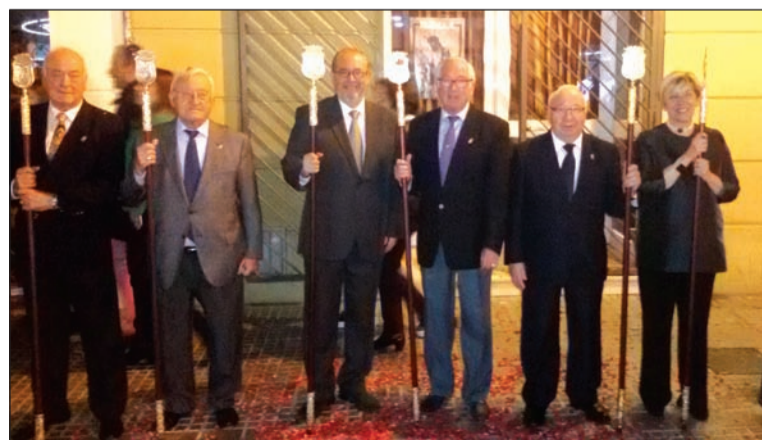
Componentes de la Federación tras una petalada.