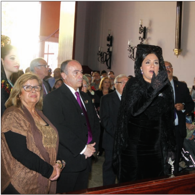
Saeta interpretada en la Casa Hermandad del Rocío.