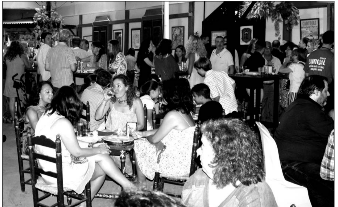
Ambiente en el interior de una caseta.

oportunos, acompañada del certificado de la dirección técnica de las instalaciones, suscrito por técnico competente; el documento de autorización de cada una de las instalaciones (eléctrica, gas, ventilación, climatización y otras) de que disponga la caseta, expedidas por la Delegación Provincial de la Consejería competente de la Junta de Andalucía; seguro de responsabilidad civil; y plan de Emergencia y Autoprotección, si procede.