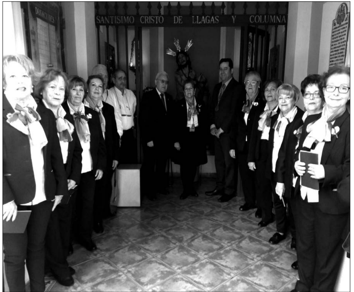
Visita a la capilla del Cristo de Llagas y Columna.