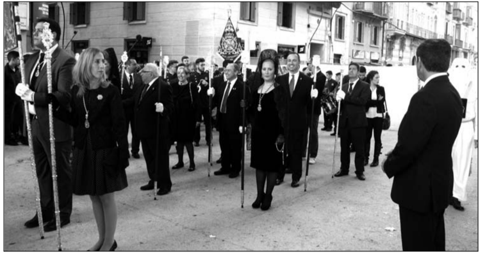
Representantes de la Federación de Peñas en el inicio del recorrido oficial.