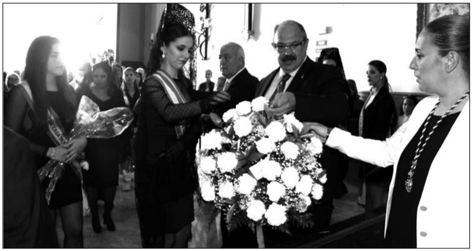
Entrega de una de las canastillas.