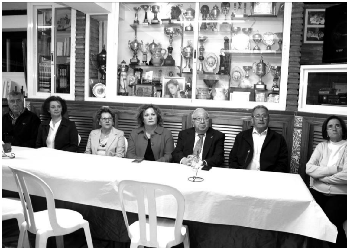
Mesa presidencial durante el acto.