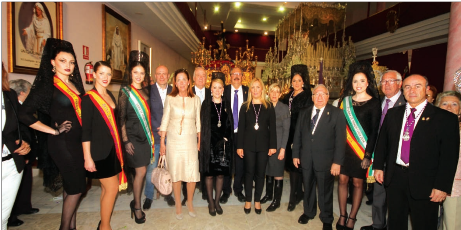
La Federación participó el Lunes Santo en la tradicional Ofrenda Floral 'Un Clavel para el Rocío'.

Número 623 19 de Abril de 2017 C/ Pedro Molina, 1 Tfno: 952 22 54 39 Fax: 952 21 48 82 E-mail: prensa@femape.com - la_alcazaba@hotmail.com Web: www.femape.com Edición digital: www.femape.com/laalcazabadigital Twitter: @FMPLaAlcazaba Facebook: www.facebook.com/FMPLaAlcazaba