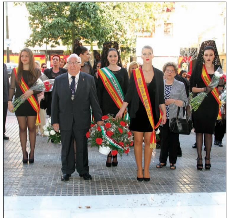
Llegada de la comitiva peñista a la Casa Hermandad.