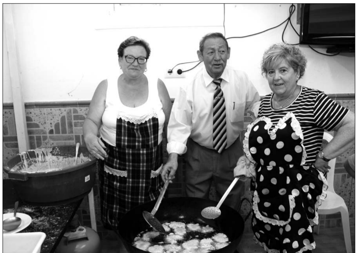
El presidente colabora para cocinar buñuelos de bacalao.