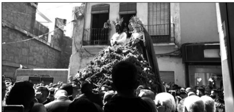
Llegada del Cautivo y la Virgen de la Trinidad a su Casa Hermandad.

Es entonces cuando se ofrece una tradicional comida en la sede de esta entidad perteneciente a la Federación Malagueña de Peñas, a la que asisten invitados como los ganadores del recién concluido Concurso Nacional de Saetas.