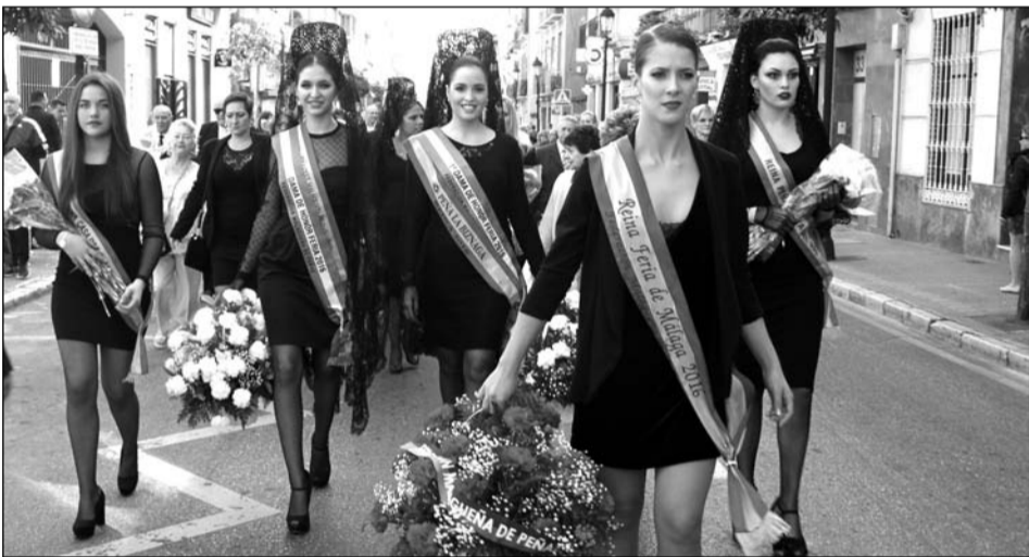
La Reina de la pasada Feria, ante las reinas de diferentes entidades.