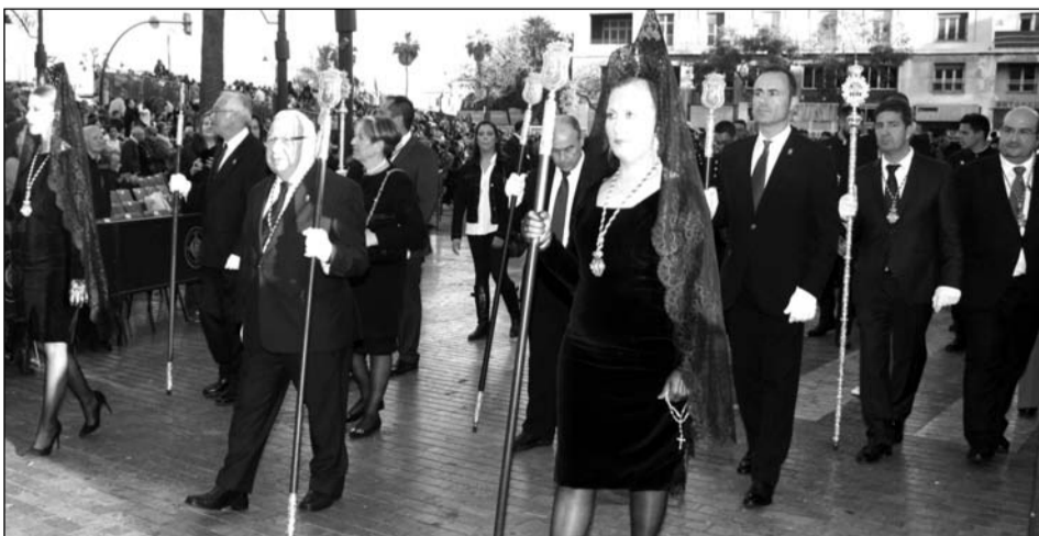
Entrada a la calle Larios.