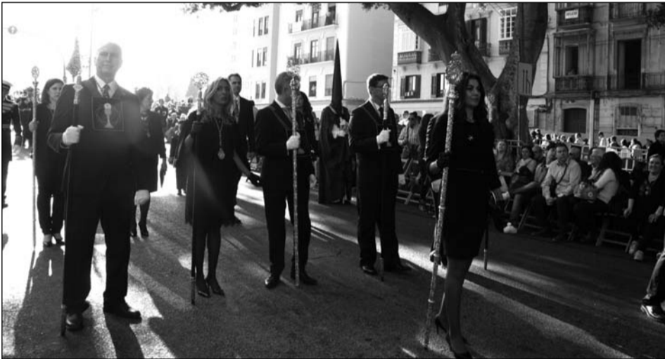
La presidencia se situó tras el trono de la Virgen.