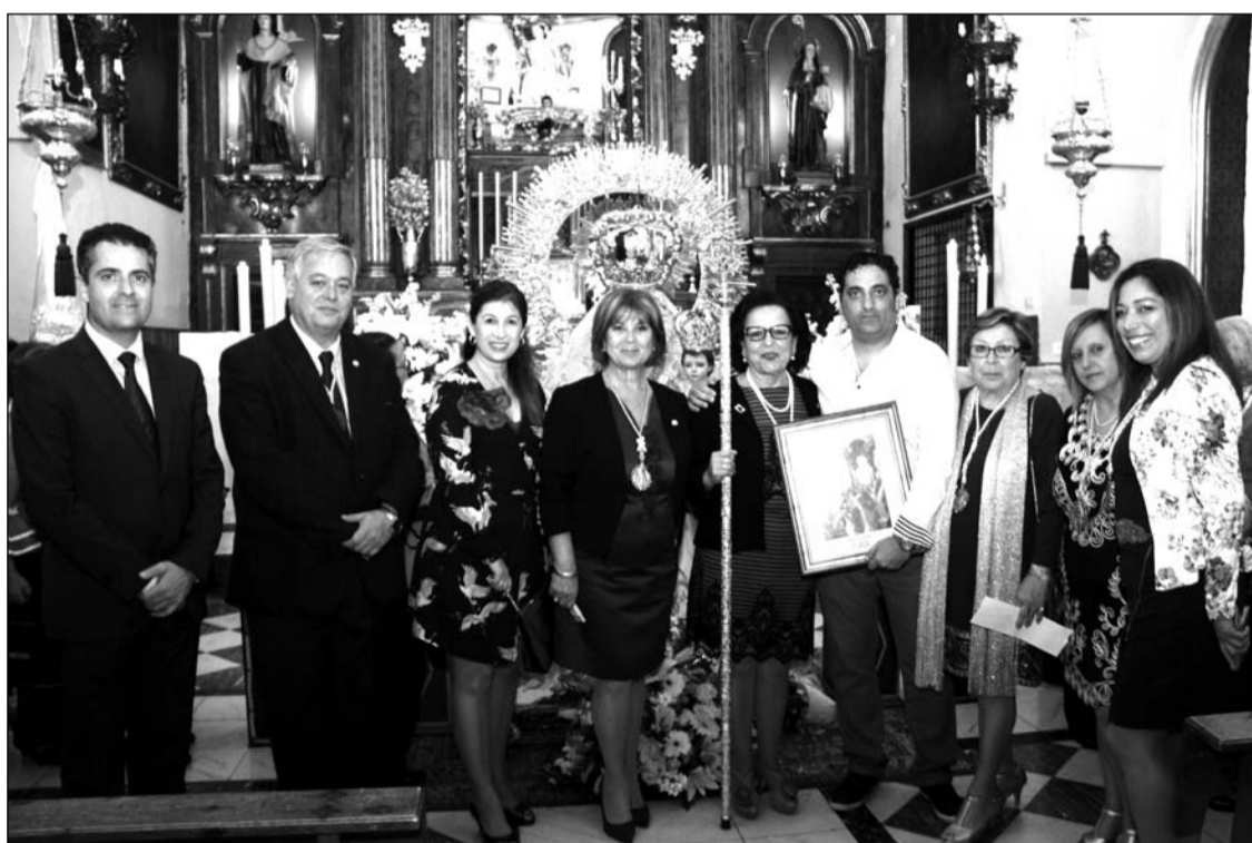
La Hermandad Romera de Nuestra Señora de la Alegría celebraba el pasado lunes 17 de abril la onomástica de su Sagrada Titular en el transcurso de un acto religioso celebrado en su sede canónica de la parroquia de la Divina Pastora.