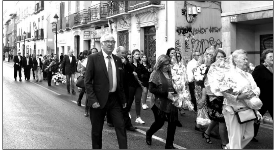
Subida por la calle de la Victoria.