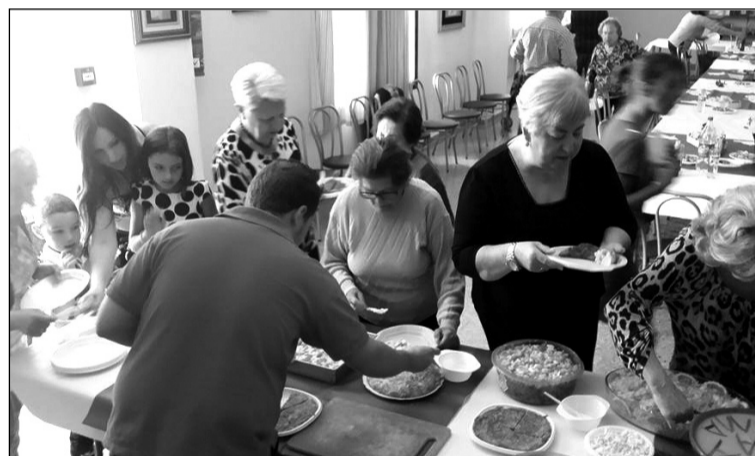
Un instante de la convivencia.

Además, de cara a fechas próximas, desde esta entidad perteneciente a la Federación Malagueña de Peñas se está organizando una fiesta el 7 de mayo con motivo del Día de las Madres; así como una excursión el 13 de ese mismo mes para conocer los Patios de Córdoba.