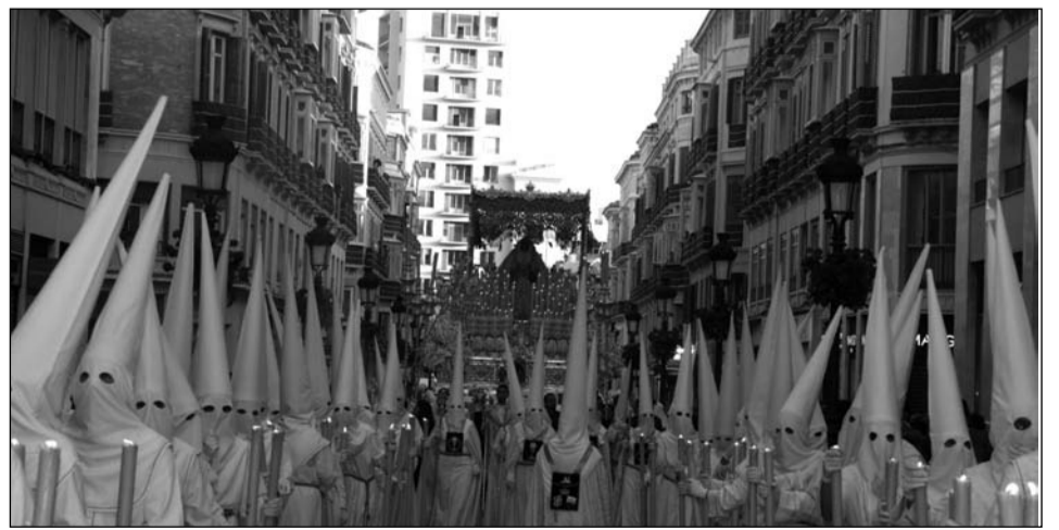
La Virgen del Rocío, acompañada por sus nazarenos.