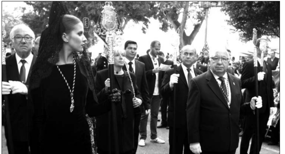
Componentes de la Federación de Peñas, con sus bastones.