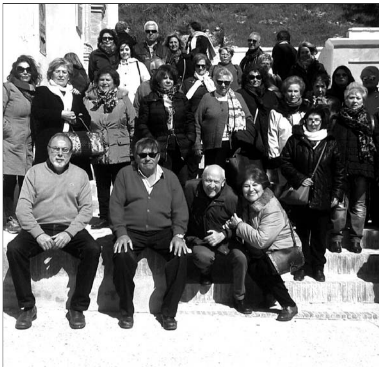
Excursión de la Peña Perchelera a la provincia de Granada.