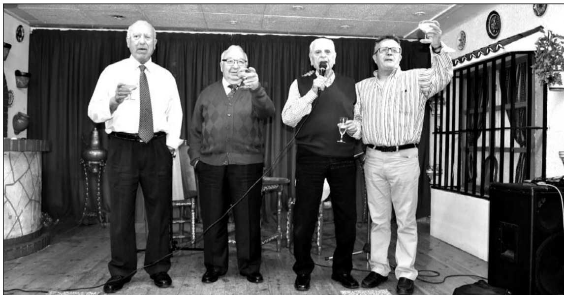
Brindis durante la comida de hermandad.