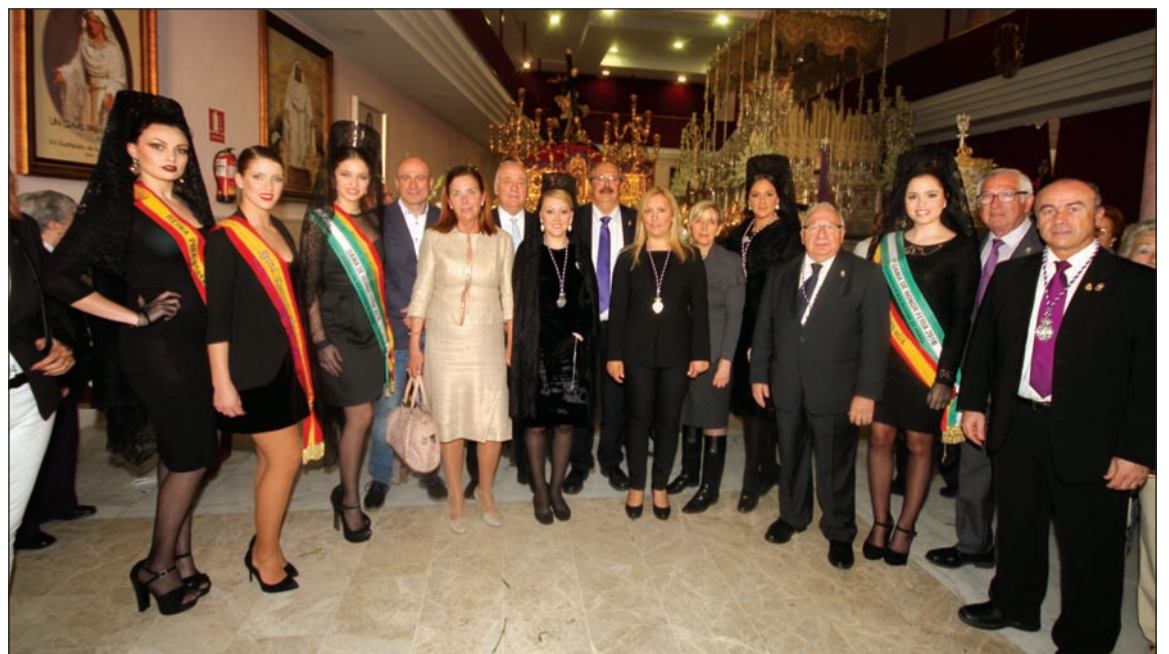
Representación de las peñas ante los tronos procesionales.