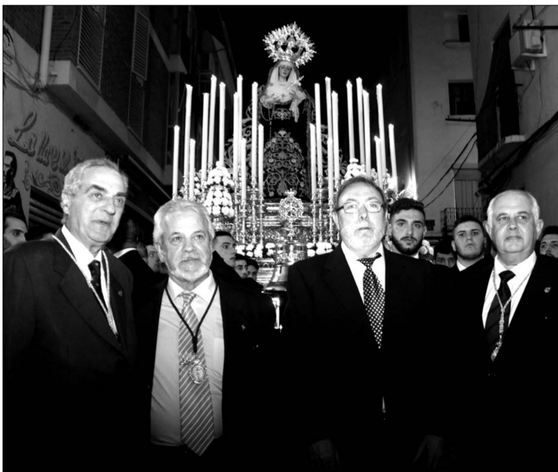
Representantes de la entidad y de la cofradía ante la Virgen de los Dolores Coronada.