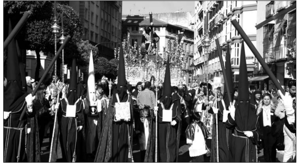
El Nazareno de los Pasos en el Monte Calvario, durante la procesión.