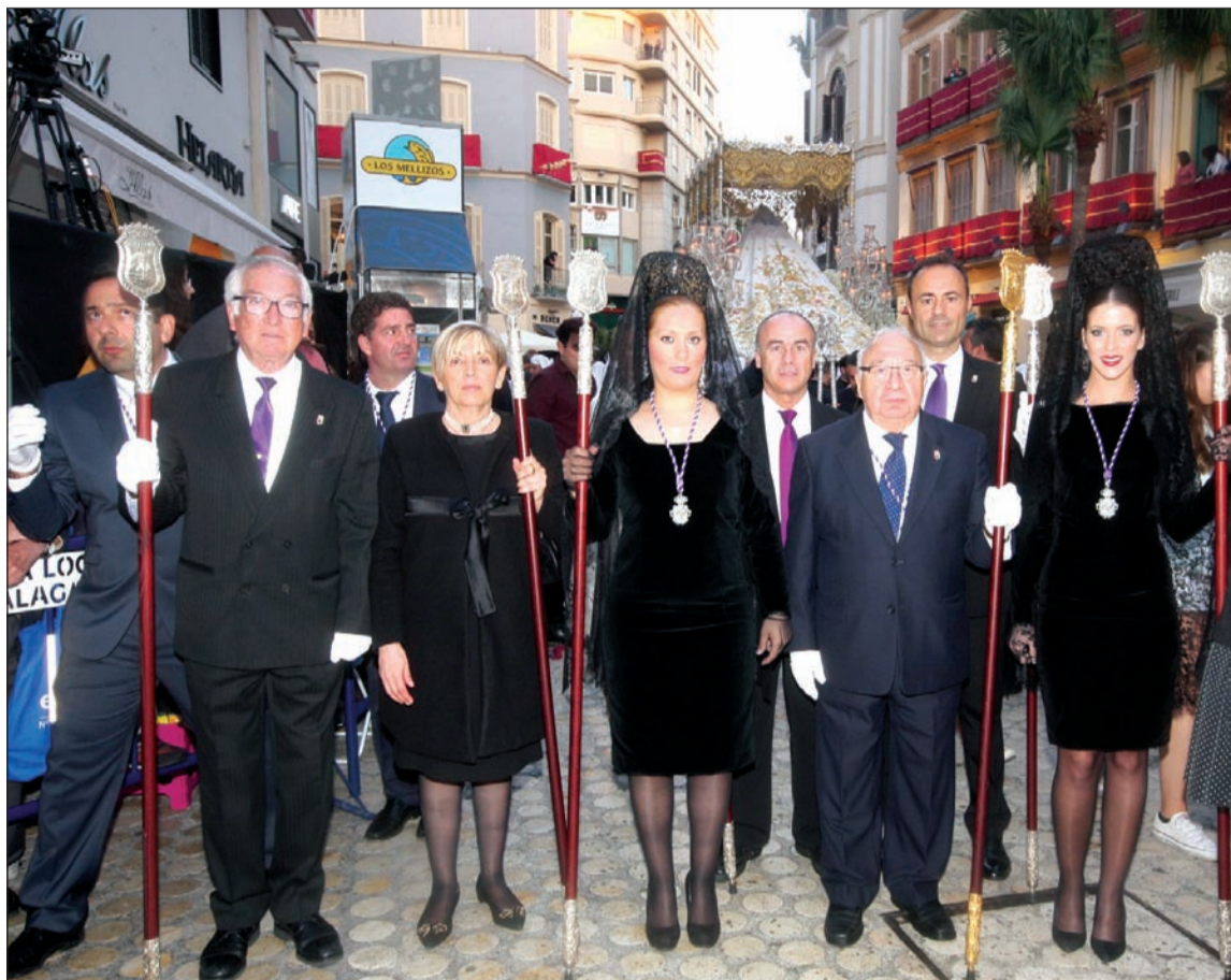
Representación peñista tras el trono de la Novia de Málaga.