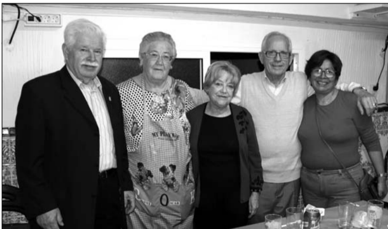
La Peña Los Rosales congregó a un buen número de socios.