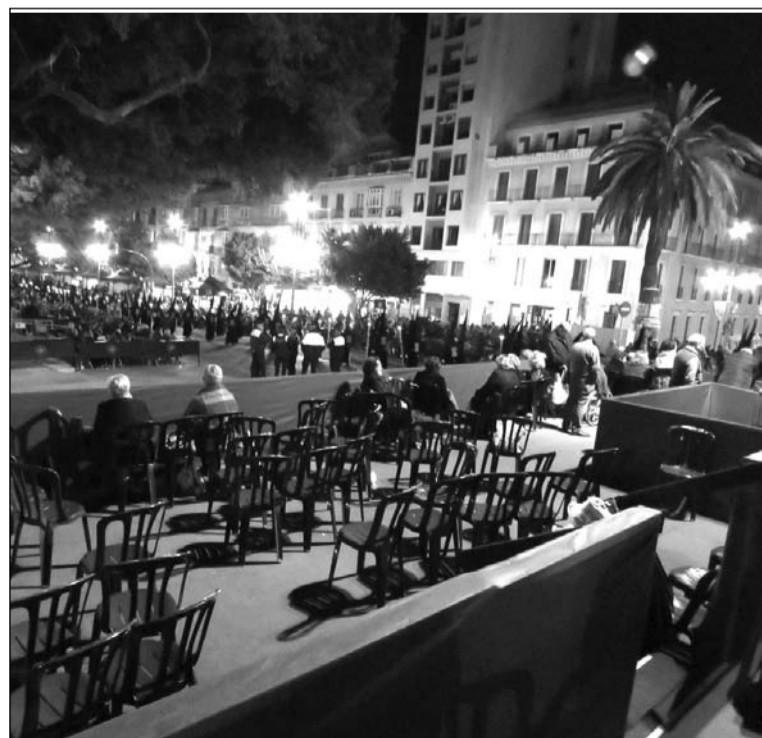
Aspecto de la tribuna durante el paso de una procesión a su derecha.

Por último, recordarle que hemos trabajado duramente a lo largo de nuestras vidas y nos molesta muchísimo tener que soportar este tipo de situaciones. Y, por favor, dígame a los responsables del tema que se pongan, de vez en cuando, nuestros 'mocasines'. Gracias.