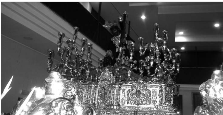
El Nazareno de los Pasos en el Mmonte Calvario.