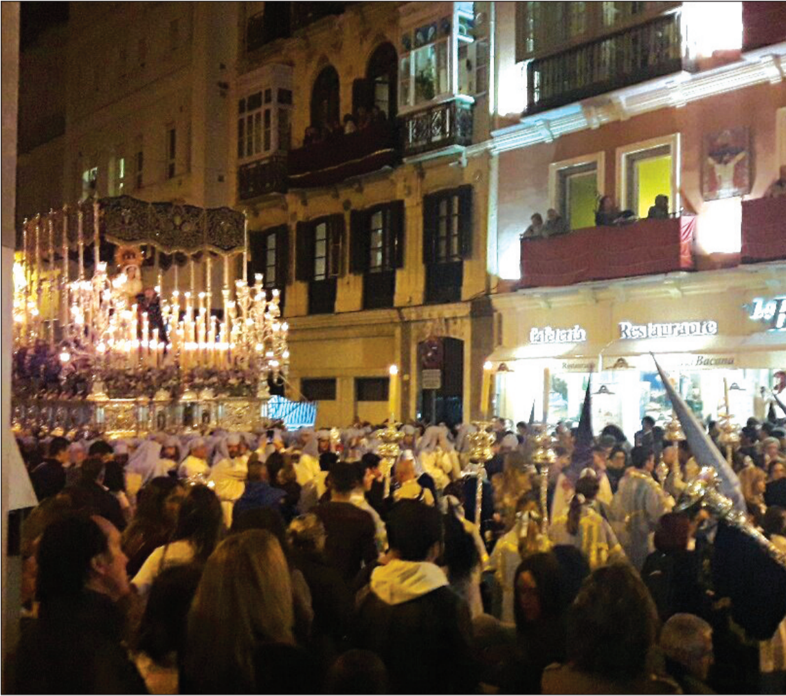
LA Virgen del Rosario, de la Hermandad de la Sentencia, mientras se le dedicaba una saeta.

◆ Federación Malagueña de Peñas, Centros Culturales y Casas Regionales 'La Alcazaba'