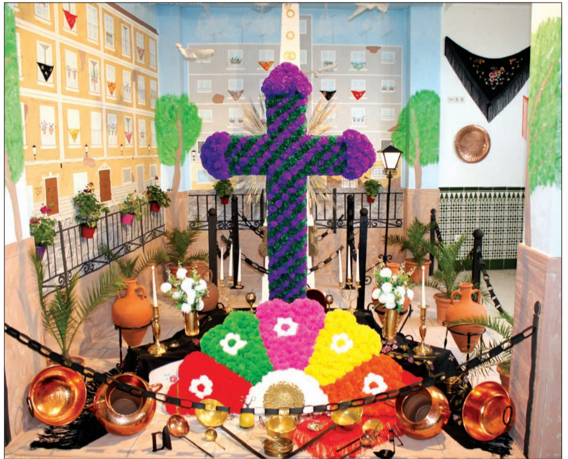
Cruz de Mayo de Avecija, primer premio del concurso del pasado año.

Los componentes del jurado entregarán el veredicto del XXVII Certamen Cruces de Mayo al secretario general de esta Federación, en sobre cerrado. Su decisión será inapelable.