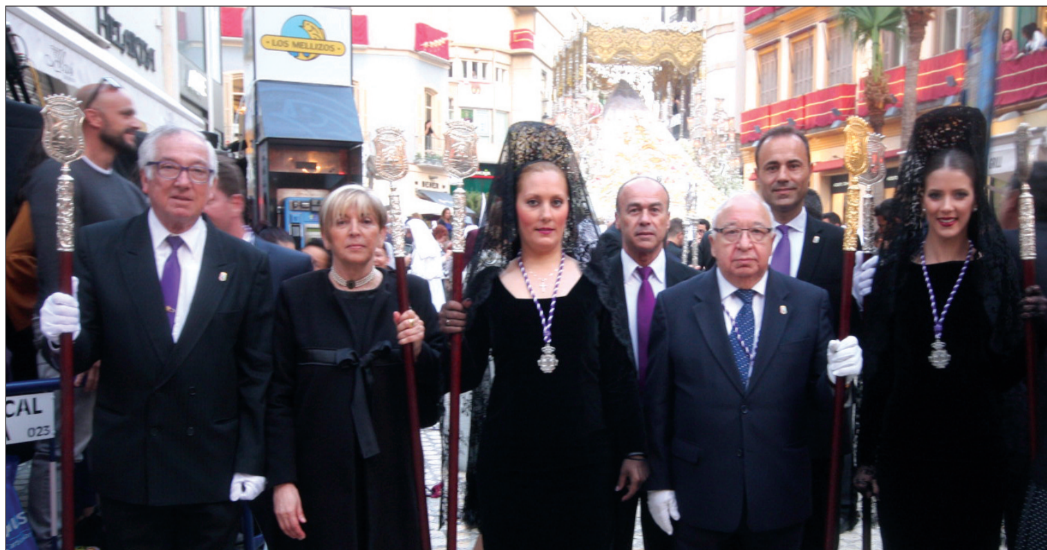
Representación del colectivo peñista tras la Novia de Málaga durante su procesión del Martes Santo.