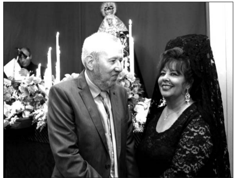
La Peña El Seis Doble realizó un acto con mucho sabor cofrade.