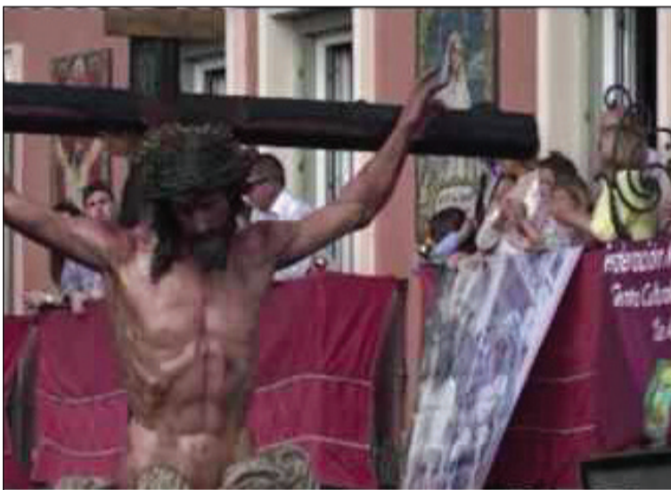
El Cristo de la Crucifixión ante el balcón de la Federación.

Para ello se ha contado con la presencia de diferentes saeteros, que han realizado unas sentidas interpretaciones que han sido muy bien acogidas por el pueblo de Málaga que han respondido con atronadoras ovaciones y vivas a los Titulares.