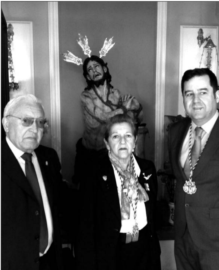
Se realizó una ofrenda floral.