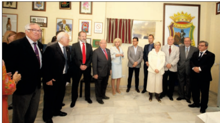
Asistentes al acto, en la sala de exposiciones de la Federación.