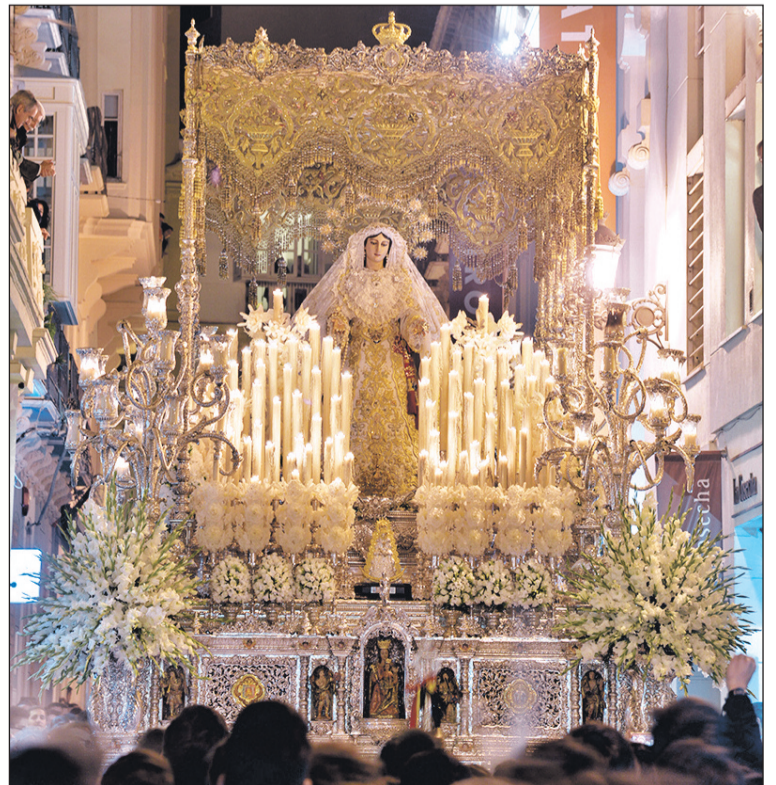
Imagen que ilustra el cartel de la Ofrenda Floral.

Al día siguiente, se completará con la Estación de Penitencia los cultos de esta corporación cofrade. De este modo, en su regreso al barrio de la Victoria, la procesión pasará por la sede de la Federación Malagueña de Peñas, Centros Culturales y Casas Regionales 'La Alcazaba', que será engalanada para la ocasión. Cuando pasen los tronos, se hará entrega de una canastilla de flores para cada uno de los Sagrados Titulares, y se le ofrecerán saetas. Además, una representación de la Federación formará parte del cortejo procesional con su participación en la presidencia de la misma durante el recorrido.