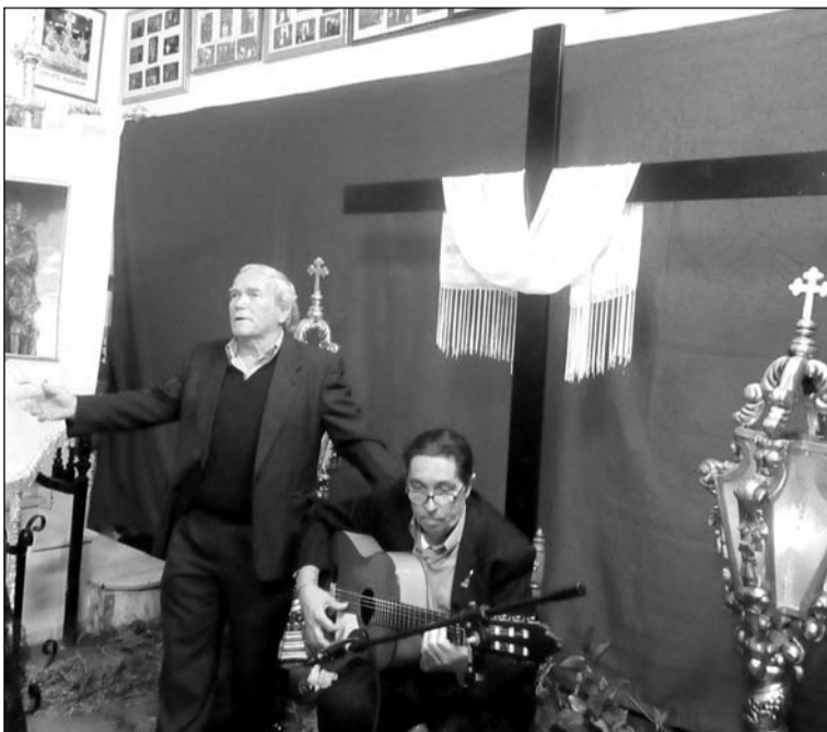
El acto contó con la interpretación de saetas.