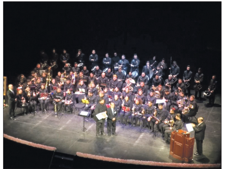
Actuación de la Agrupación Musical San Lorenzo Mártir.