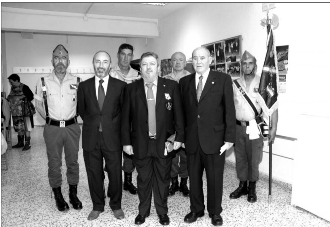
Representación de la Hermandad de Antiguos Caballeros Legionarios de Torremolinos.