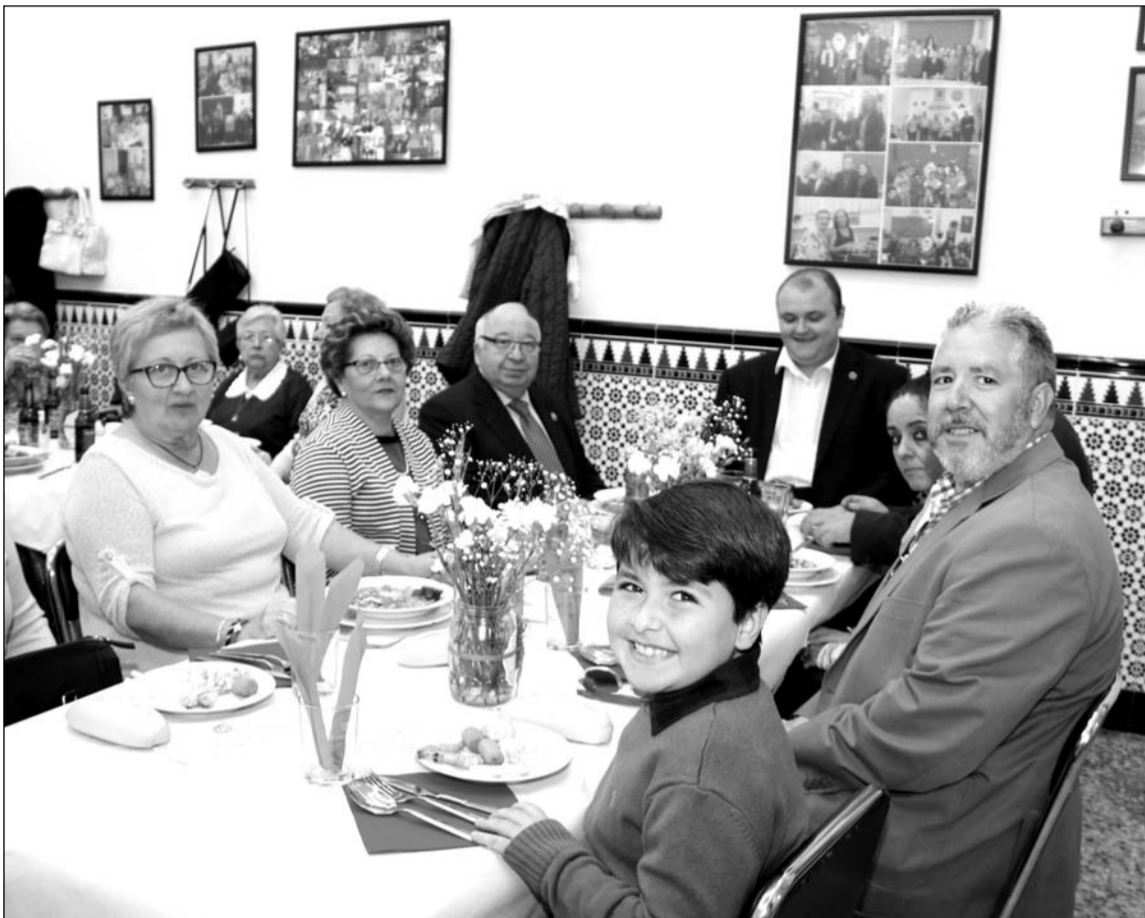
Mesa presidencial durante esta comida de hermandad.