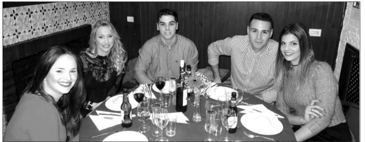
Jovenes peñistas en El Palustre.

Después de la entrega de las respectivas bandas y regalos comenzó la fiesta, con barra libre y música hasta altas horas.