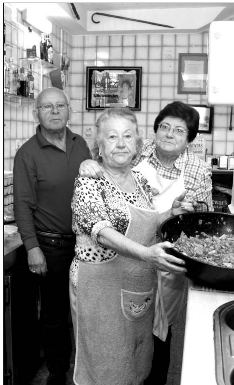
Preparación de la comida por los socios de la Peña El Bastón.