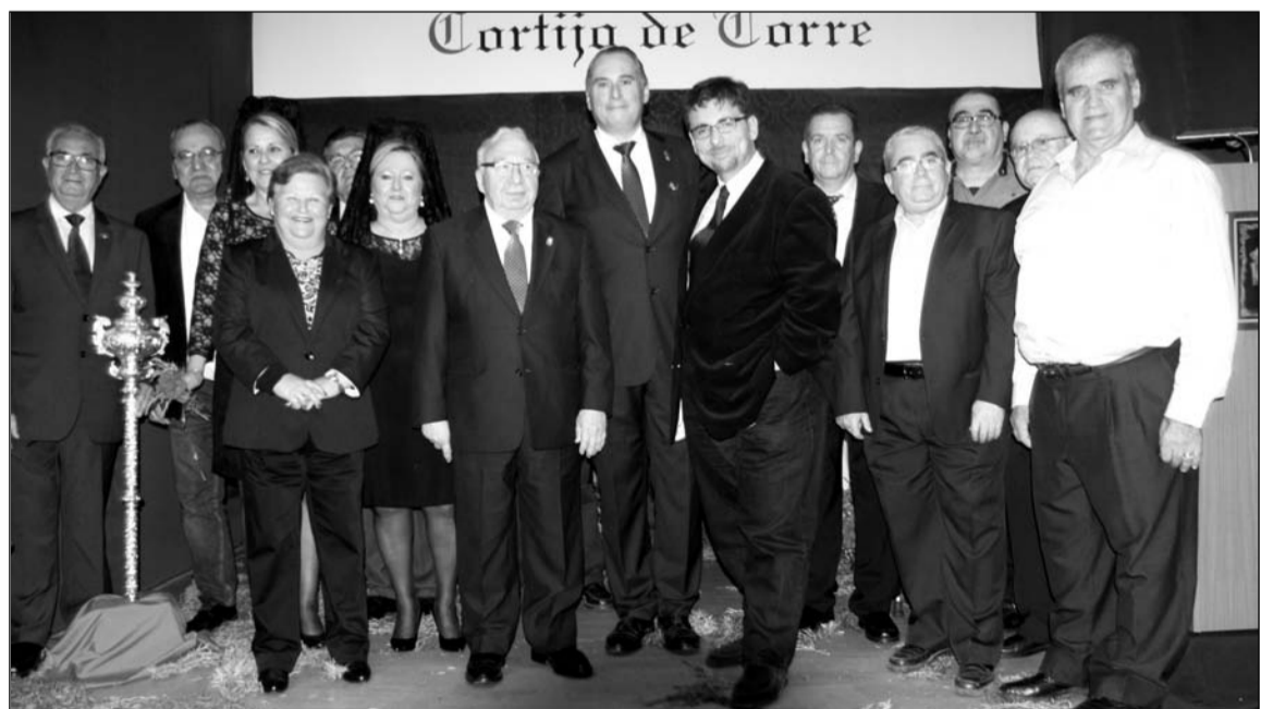
Socios, invitados y participantes en el acto.