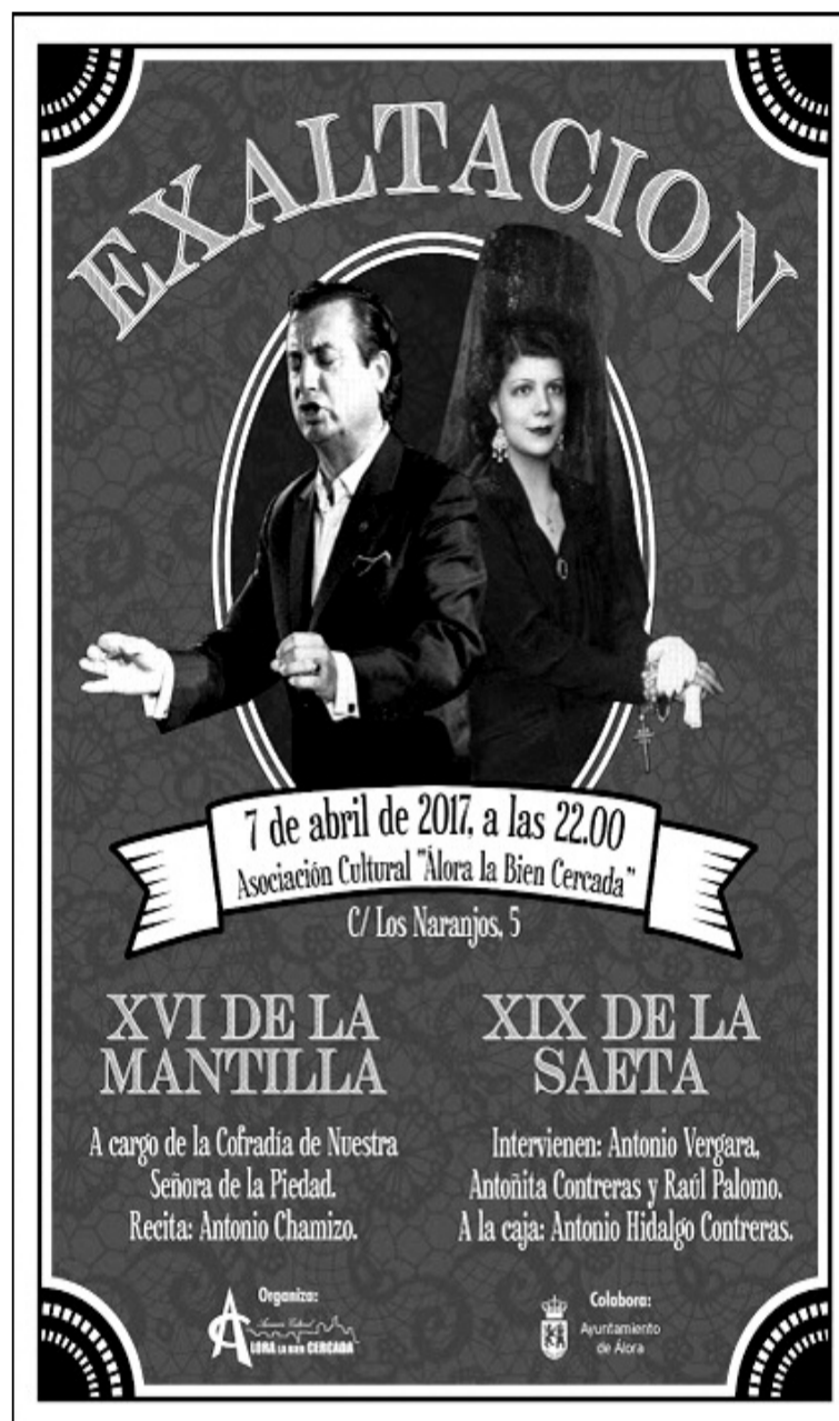
Cartel de esta doble actividad.