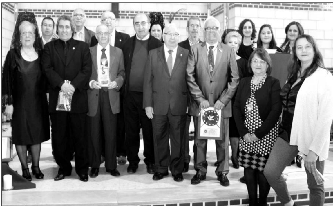
Participantes en el acto con componentes de la asociación e invitados.