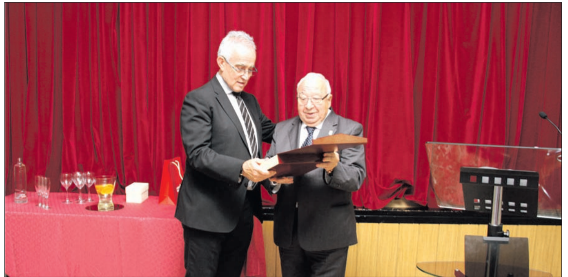
La Federación de Peñas entrega un recuerdo a través de su presidente.