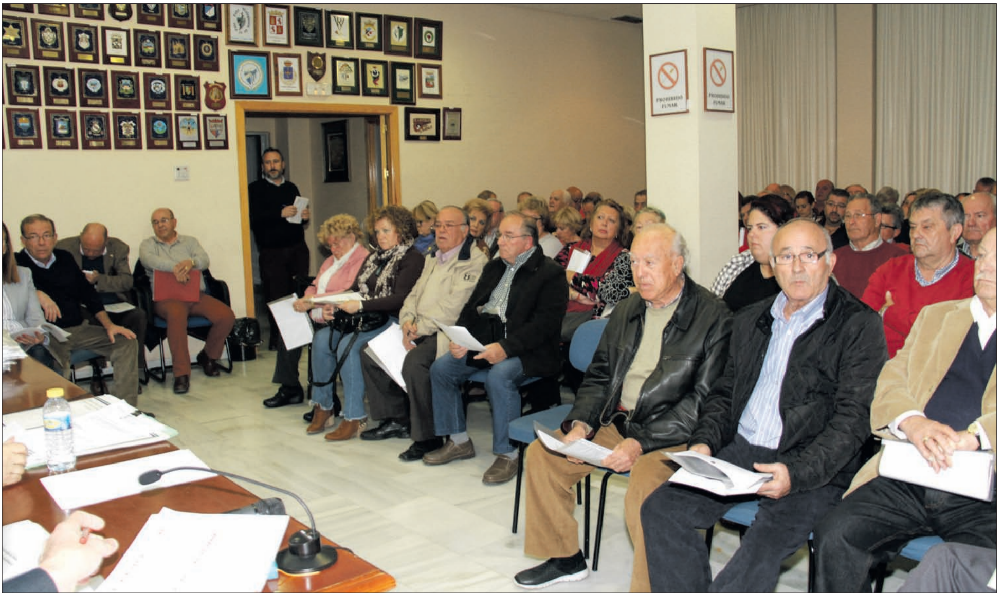
Presidentes y representantes de las entidades asistentes a la Asamblea General Extraordinaria.

tenido, se consideró retirar el borrador y posponer su aprobación a después del proceso electoral.