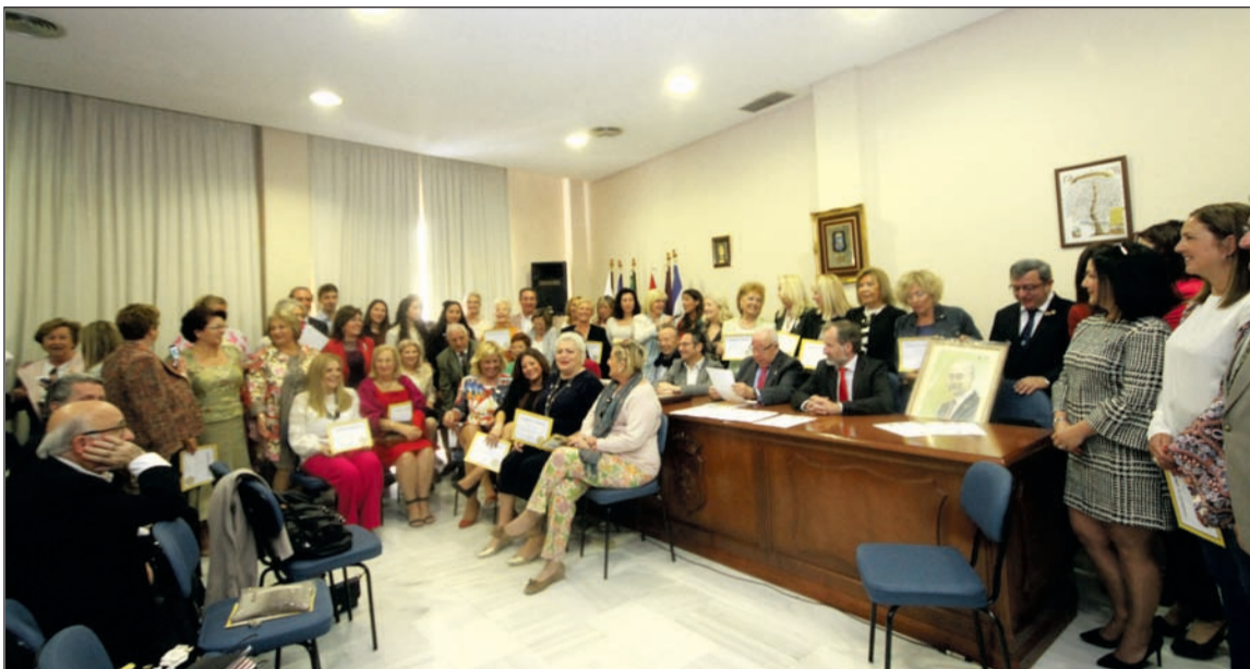
Asistentes al acto.