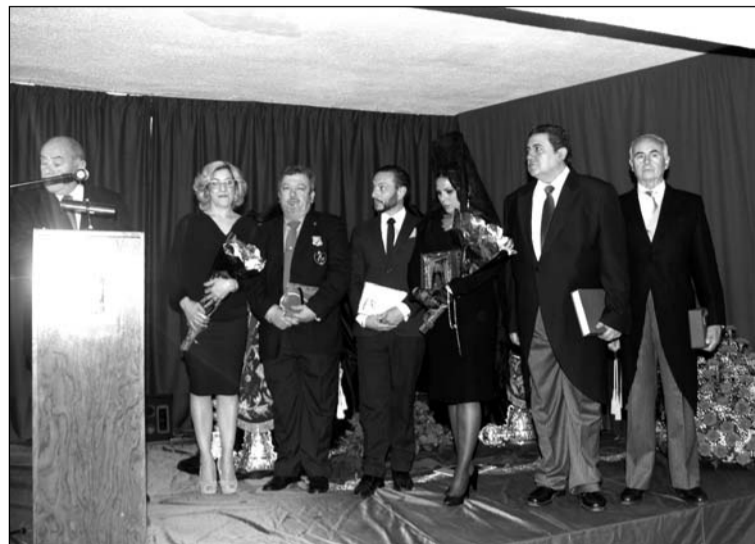
Agradecimientos tras la exaltación.