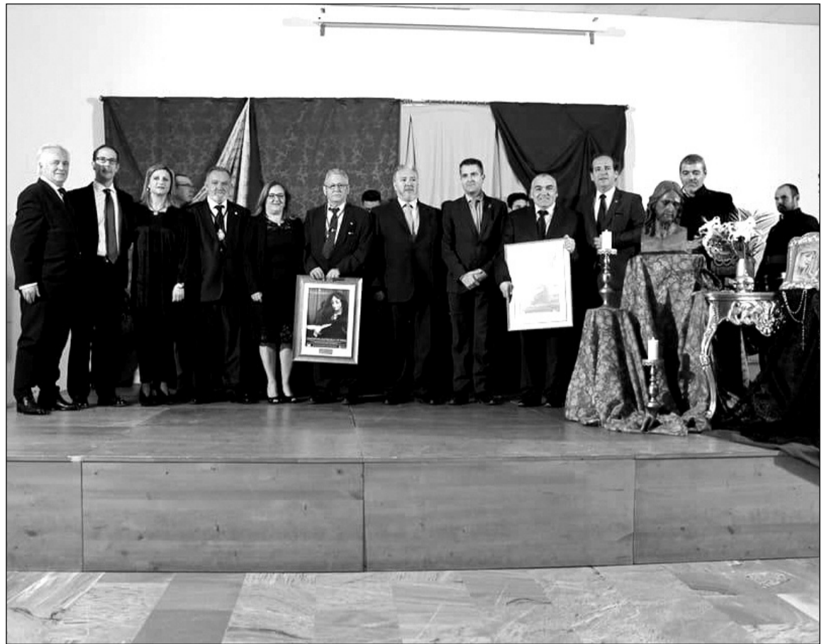
Acto de Exaltación de la Mantilla en Avecija