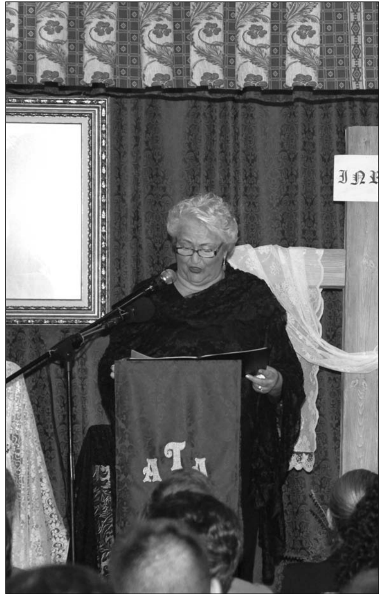
Un instante de la Exaltación de la asociación.