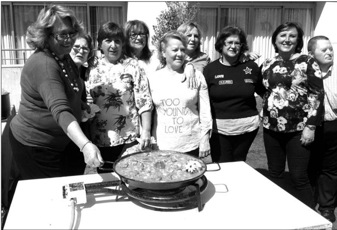
Socias de la Peña Cultural Malaguista de Ciudad Jardín ante la paella que prepararon.