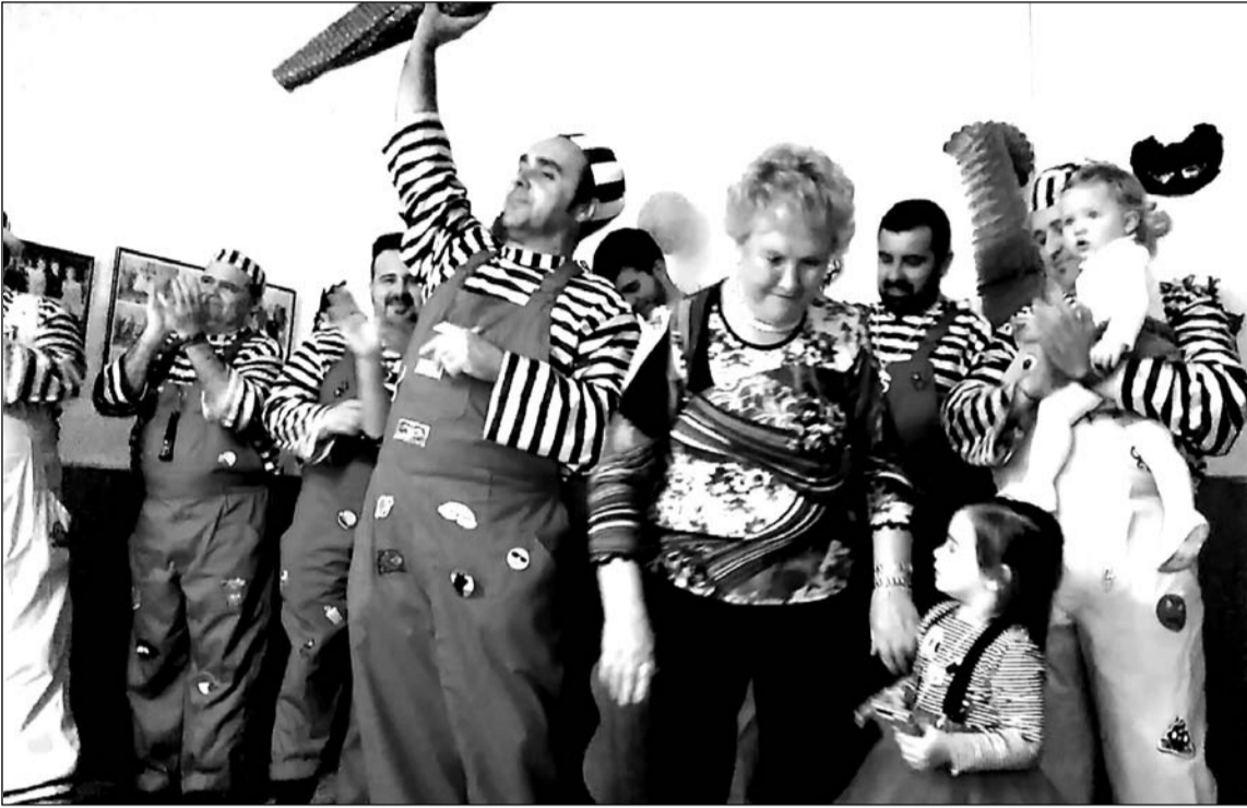
La presidenta de la entidad entregó un recuerdo a la Murga Los Cantalegos.