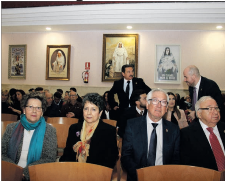
Representación peñista en este acto.