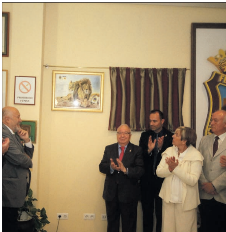
Descubrimiento de un cuadro conmemorativo.