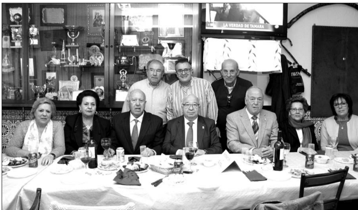
Peñistas asistentes a esta comida de hermandad.

También se contó con la presencia de presidentes de otras entidades federadas con las que la Peña El Bastón se encuentra hermanada.