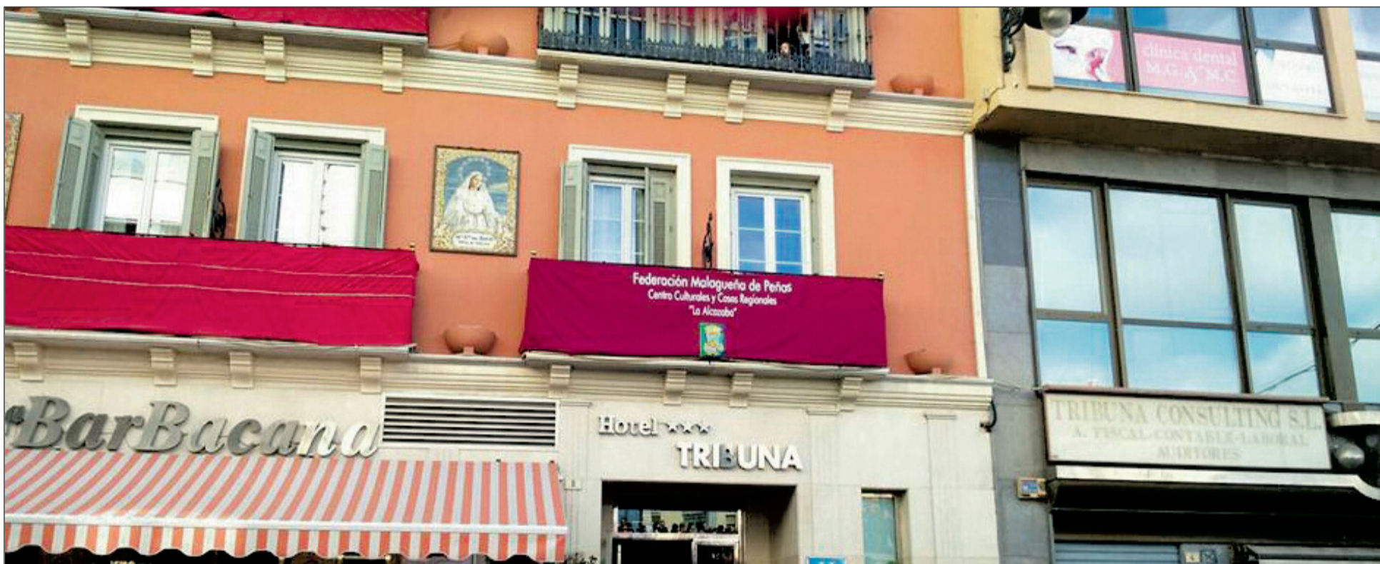
Balcón del hotel Tribuna desde donde se volverán a cantar saetas.

Asumiendo que cada cofradía o hermandad es soberana de hacer su estación de penitencia como decidan sus hermanos, únicamente con el objetivo de recuperar y potenciar nuestro patrimonio y acervo cultural, la Federación Malagueña de Peñas, Centros Culturales y Casas Regionales se ha ofrecido a dedicar una Saeta al paso de los Sagrados Titulares de todas las hermandades que discurren por la Tribuna de los Pobres en la Semana Santa de Málaga 2017.