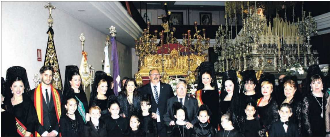
Ofrenda de la Federación de Peñas el pasado año en la Casa Hermandad del Rocío.