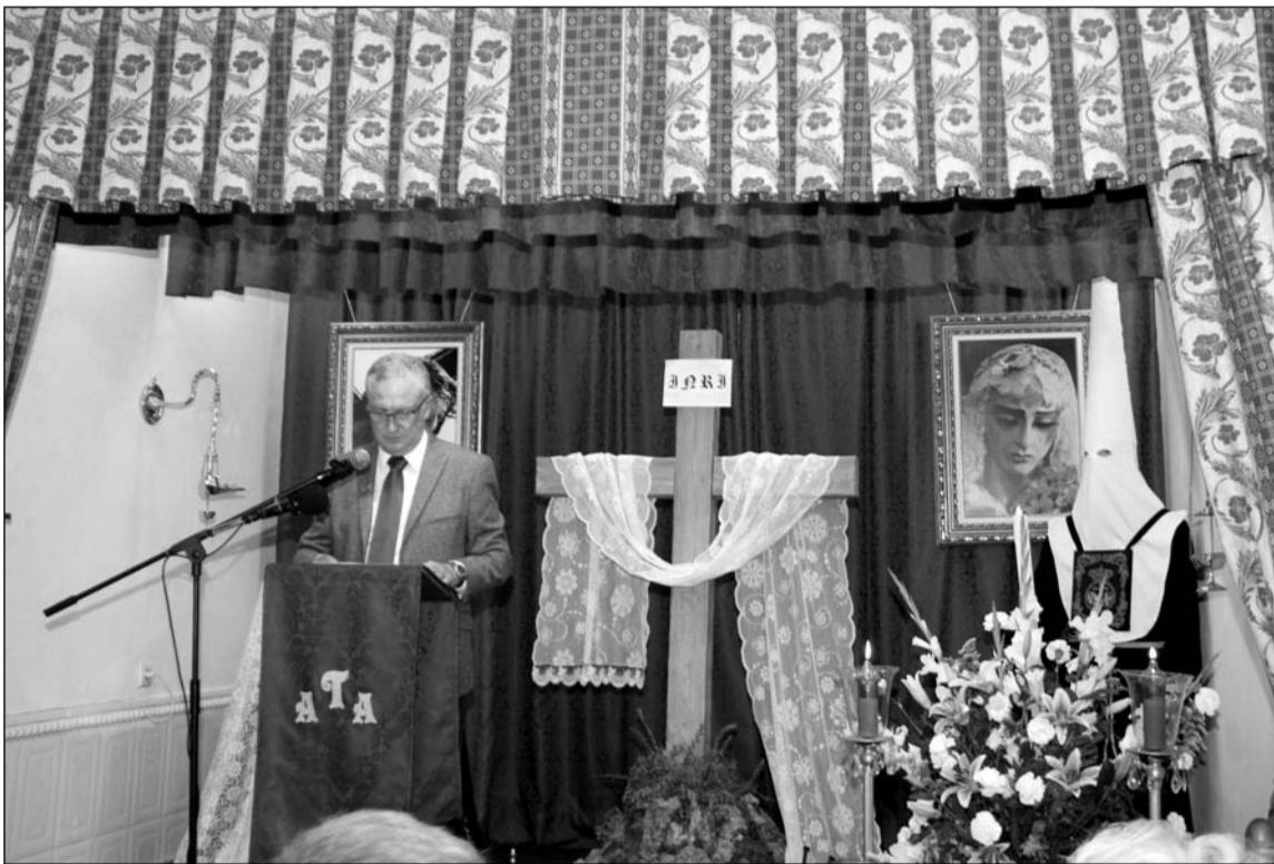
Vista general del escenario preparado para este acto.

Sagrados Titulares de la Cofradía de Jesús Nazareno del Paso y la Virgen de los Dolores, corporación que hará su estación de penitencia como es tradicional en la noche del próximo 7 de abril, Viernes de Dolores.