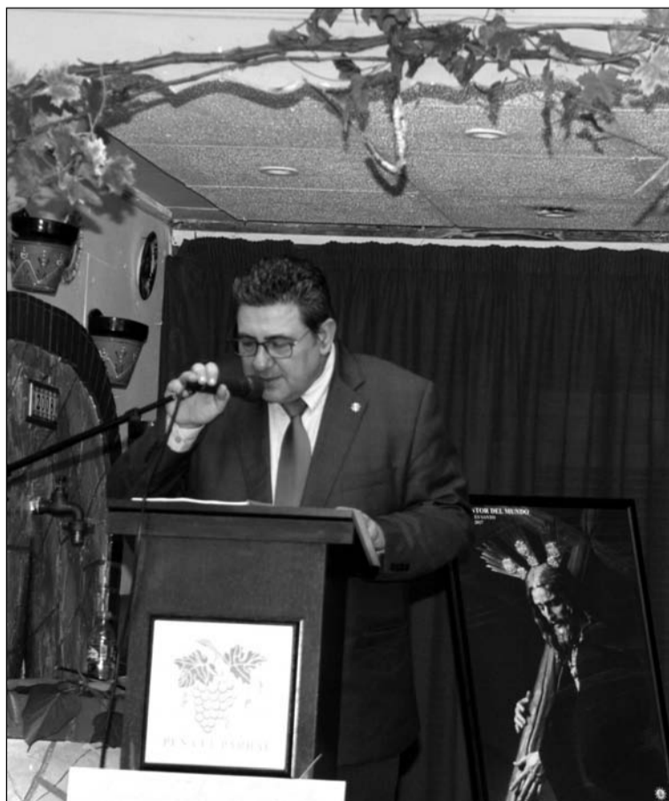
Un momento del pregón, con la imagen del Redentor del Mundo al fondo.

Dos imágenes del Nazareno Redentor del Mundo y María Santísima Mediadora de la Salvación presidían el altar.