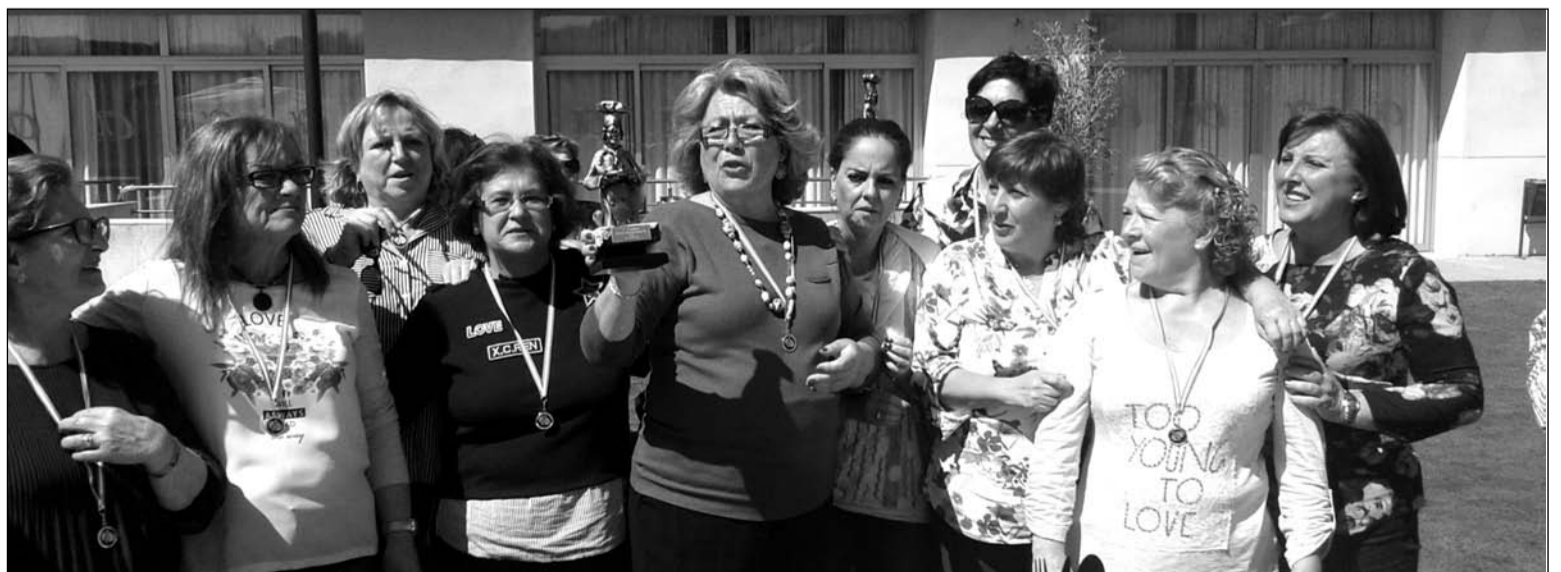
La presidenta recoge el trofeo durante la entrega de premios del concurso de paellas.