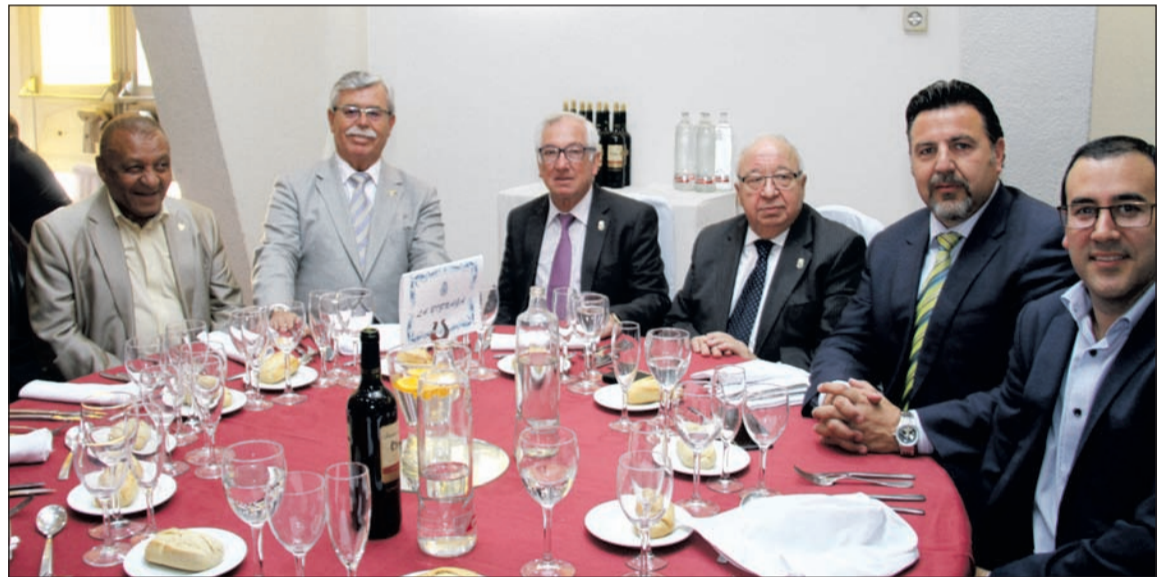
Representantes de la Federación con dirigentes del Málaga C.F. y otros colectivos.