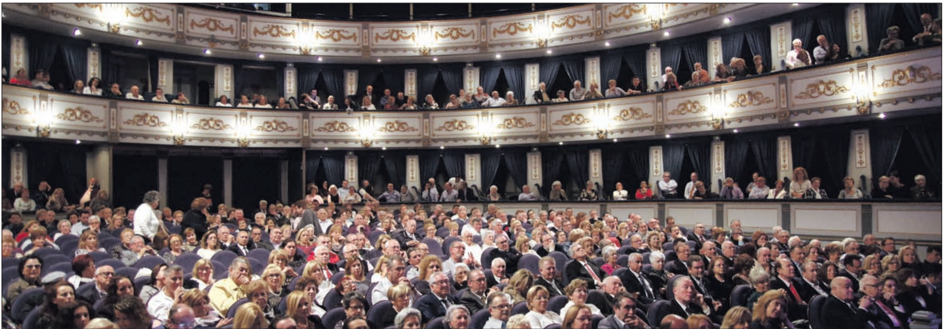
El Cervantes presentaba este aspecto para disfrutar de la gran final.