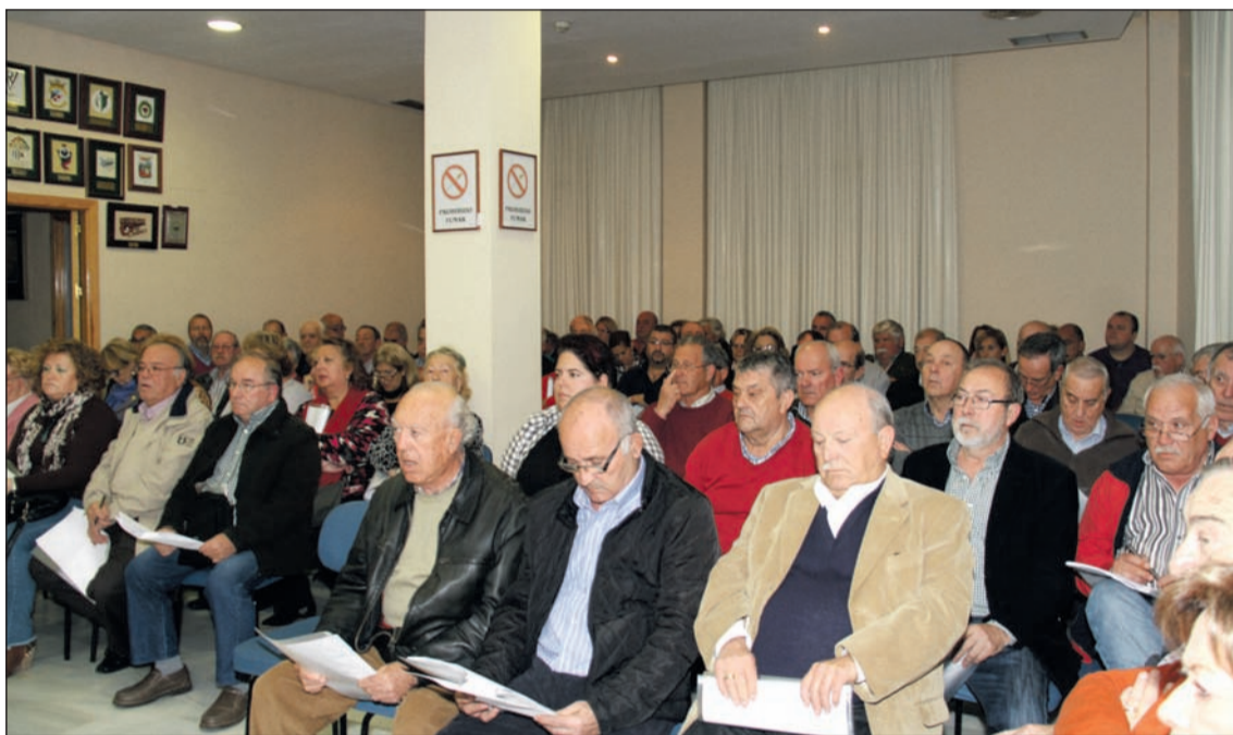
Aspecto que presentaba el salón de actos de la Federación durante la Asamblea.

Número 622 5 de Abril de 2017 C/ Pedro Molina, 1 Tfno: 952 22 54 39 Fax: 952 21 48 82 E-mail: prensa@femape.com - la_alcazaba@hotmail.com Web: www.femape.com Edición digital: www.femape.com/laalcazabadigital Twitter: @FMPLaAlcazaba Facebook: www.facebook.com/FMPLaAlcazaba