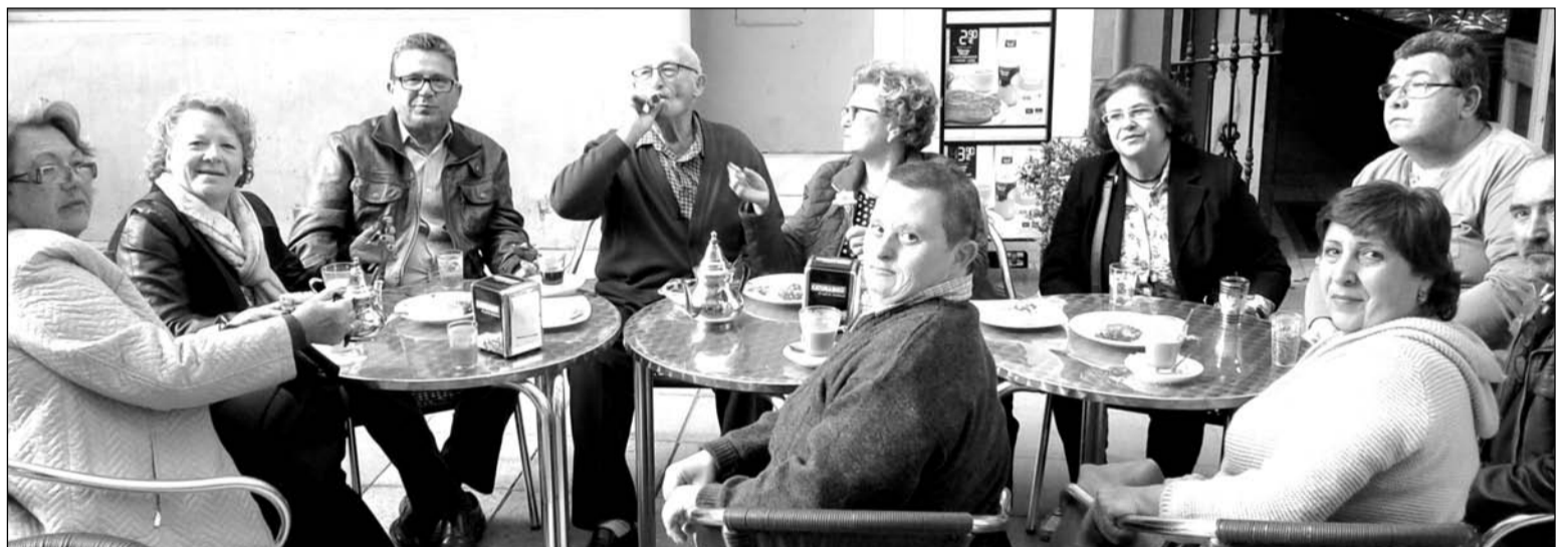
Un grupo de socios disfrutando del fin de semana en la costa gaditana

Ya de cara al mes de mayo, la Peña La Solera está planteando realizar una nueva comida de hermandad con un menú especial a base de marisco y pescado.