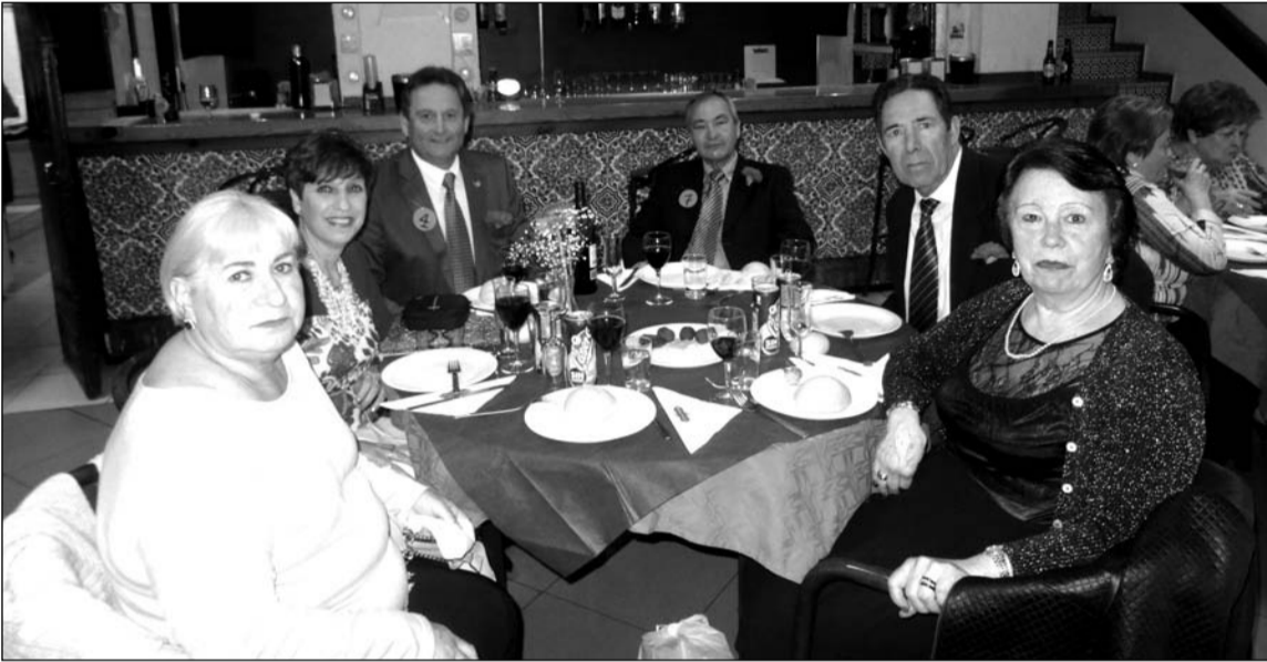
Socios durante la Cena del Día del Padre.