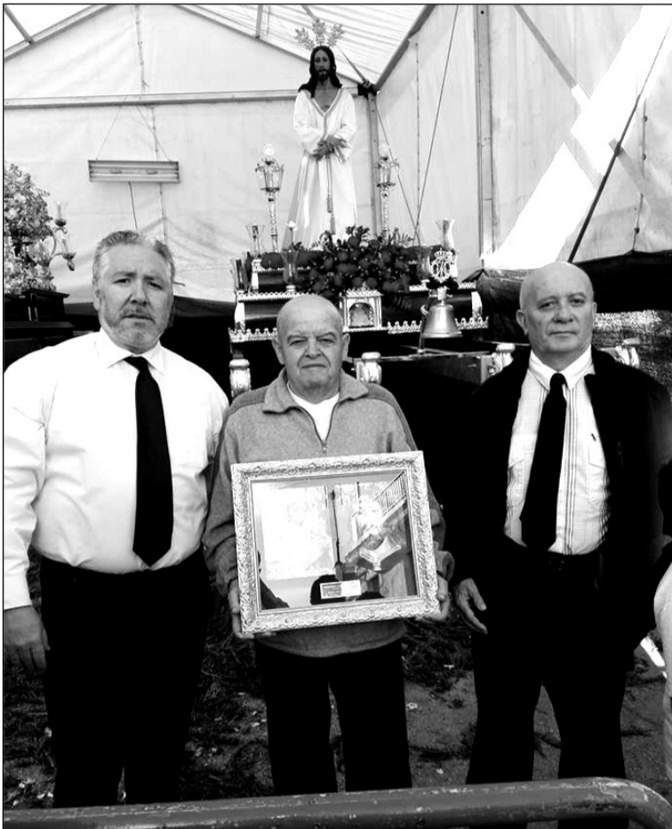
Agradecimiento de la Cofradía de Mangas Verdes a Avecija.