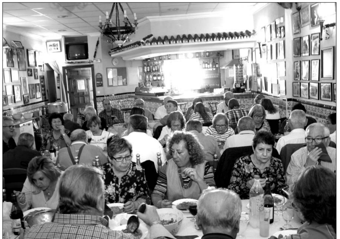
Comida previa a una actuación flamenco el pasado mes de marzo.

Además, las tertulias flamencas en este Centro Cultural Flamenco 'La Malagueña', en este mes de abril se siguen celebrando todos los miércoles de 19 a 21 horas.