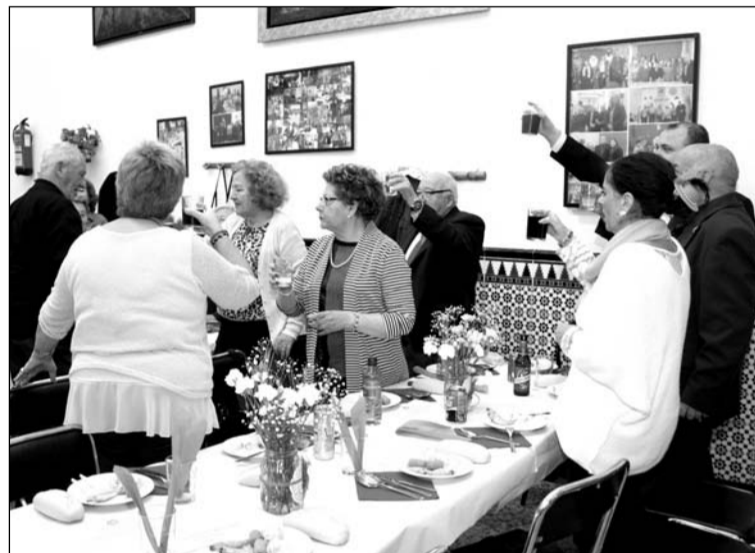
Brindis de todos los asistentes a esta actividad.

Además, una vez más, quedó mostrada la unidad que existe entre las entidades federadas con la presencia de otros presidentes como el de la Peña Recreativa Trinitaria o Avecija.