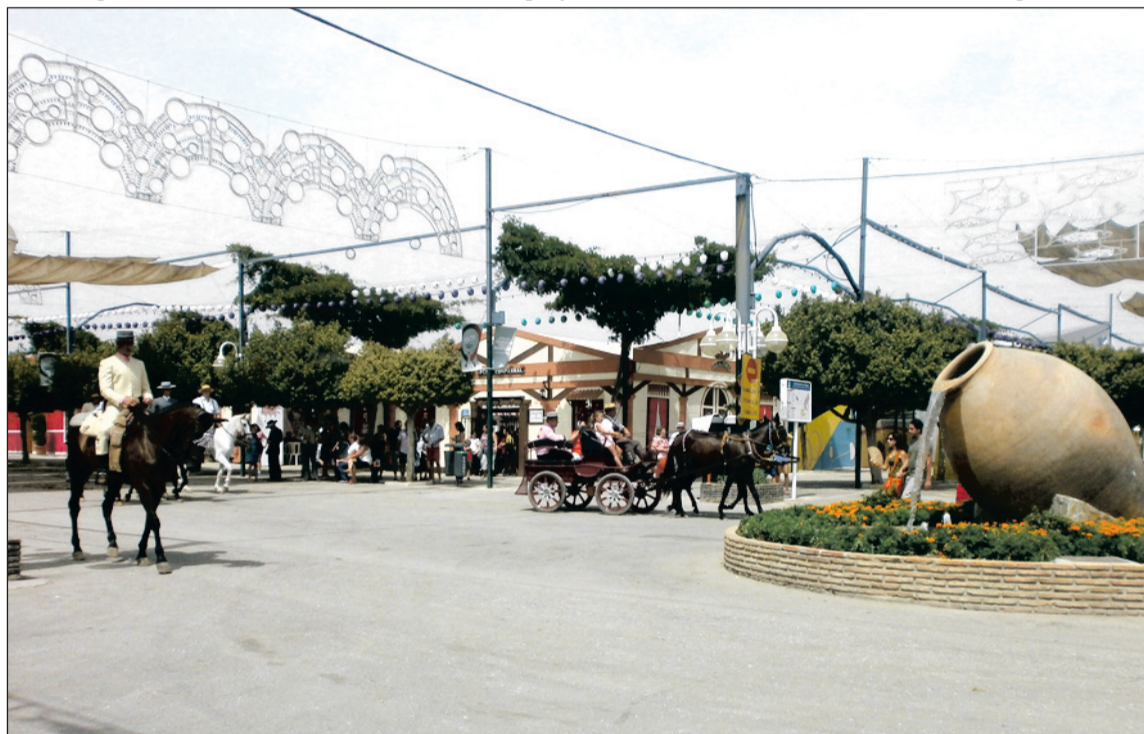
Caballistas paseando por el recinto ferial de Cortijo de Torres.

Cuando la documentación sea suficiente, desde el punto de vista técnico, y antes del 10 de agosto o día siguiente hábil, se expedirá la autorización de funcionamiento notificándola al interesado; que deberá retirar del Servicio de Aperturas del Área de Comercio y Vía Pública, durante los días inmediatamente anteriores al inicio de la Feria, la autorización expedida así como la documentación exigida, debiendo encontrarse ambas en la caseta, patio tradicional o Casa de Hermandad a disposición de la autoridad municipal a los efectos oportunos, acompañada del certificado de la dirección técnica de las instalaciones, suscrito por técnico competente; el documento de autorización de cada una de las instalaciones (eléctrica, gas, ventilación, climatización y otras) de que disponga la caseta, expedidas por la Delegación Provincial de la Consejería competente de la Junta de Andalucía; seguro de responsabilidad civil; y plan de Emergencia y Autoprotección, si procede.