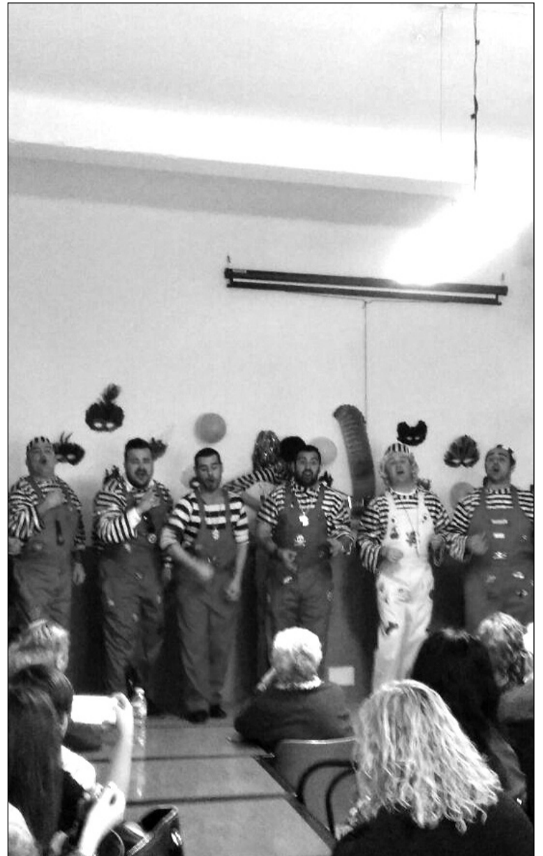
Socios disfrutaban de la actuación.

La Peña La Igualdad contó en este acto, además de con una nutrida presencia de socios, con la asistencia de representantes de otras entidades federadas como son la Peña La Paz, la Peña Ciudad Puerta Blanca y la Peña Palestina.