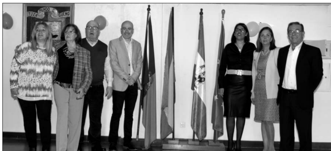
Celebración del Día de Andalucía en la Peña El Sombrero.