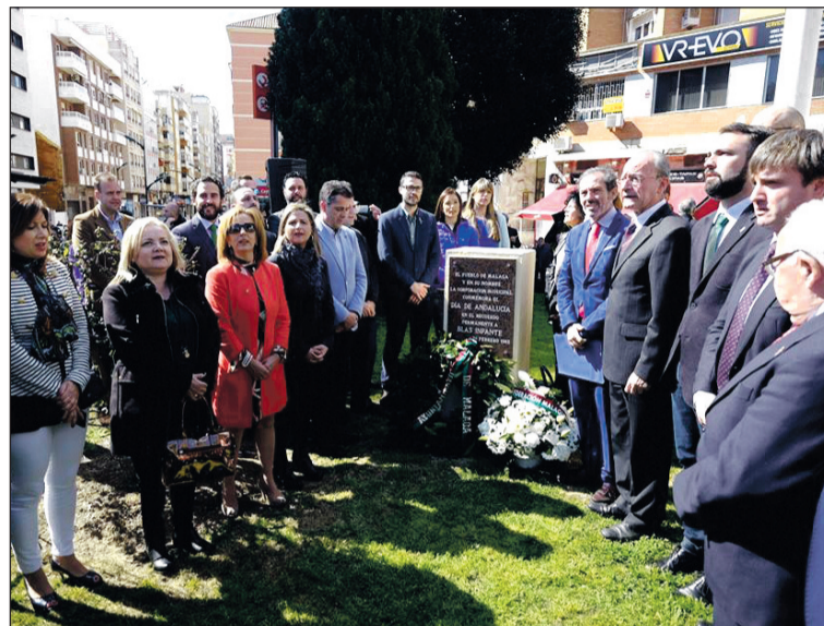
Interpretación del Himno de Andalucía.