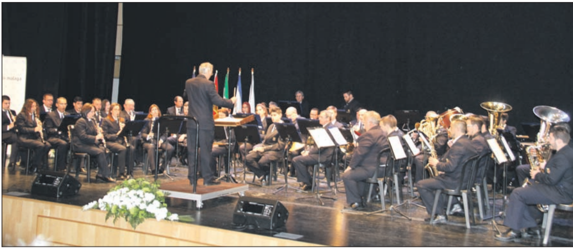
Recital de la Banda Municipal.