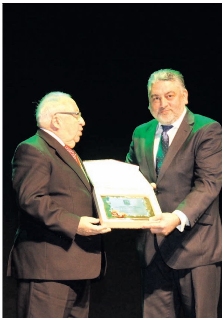
El presidente Miguel Carmona hace entrega de una placa de recuerdo.