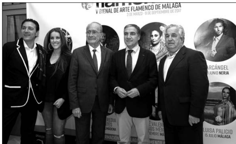
Acto de presentación de la Bienal.