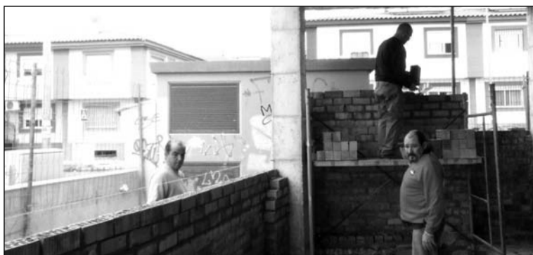
Tres socios trabajan en los cerramientos de la estructura.