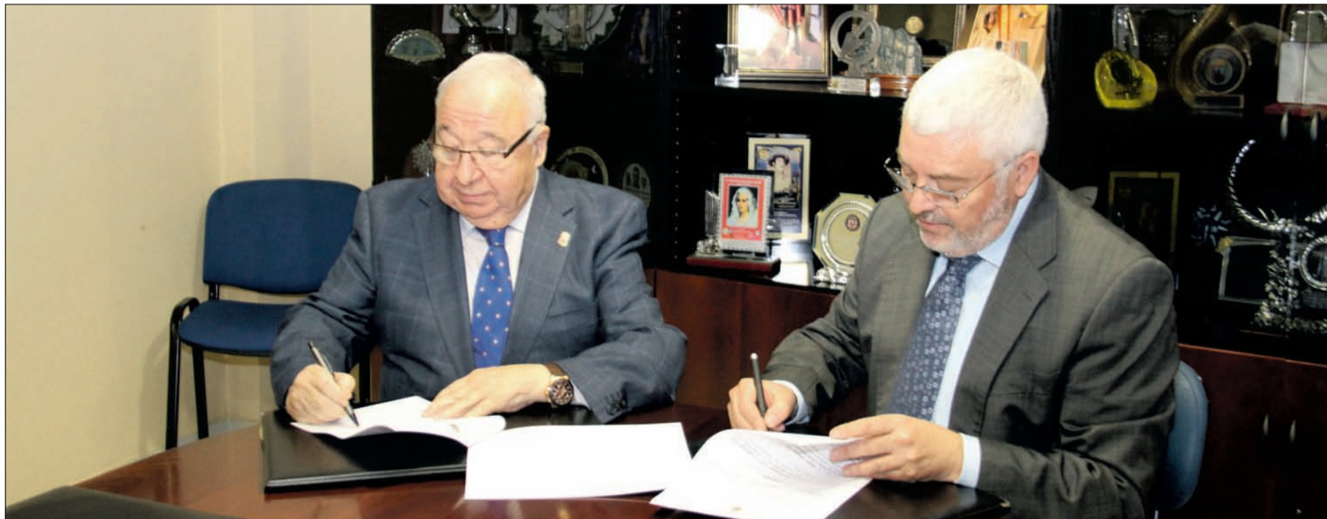
Instante de la firma del convenio, en la sala de juntas de la Federación Malagueña de Peñas, Centros Culturales y Casas Regionales 'La Alcazaba'.

Hay cosas que son exclusivamente malagueñas