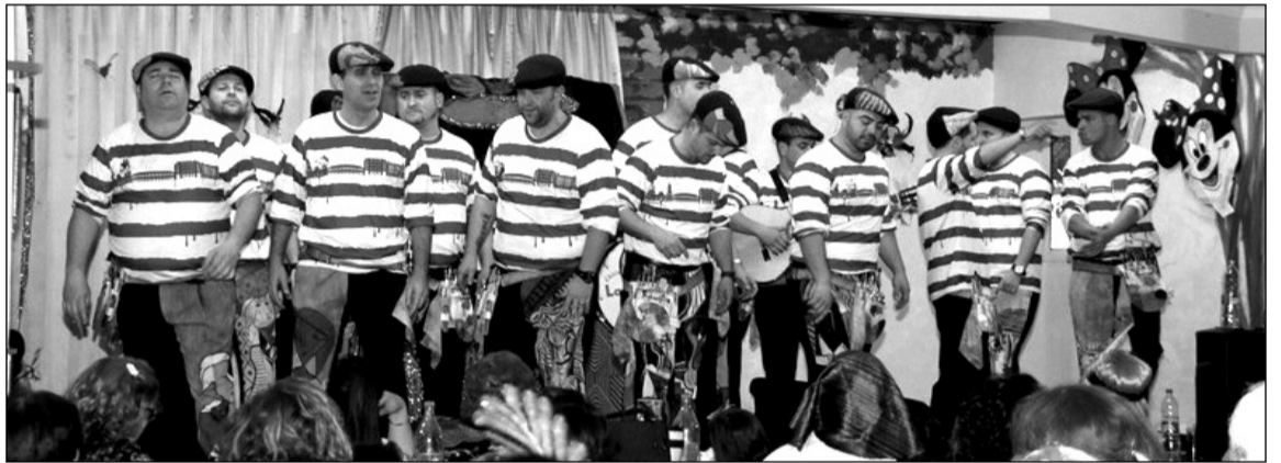
Actuación de una agrupación carnavalesca en la sede de la entidad.