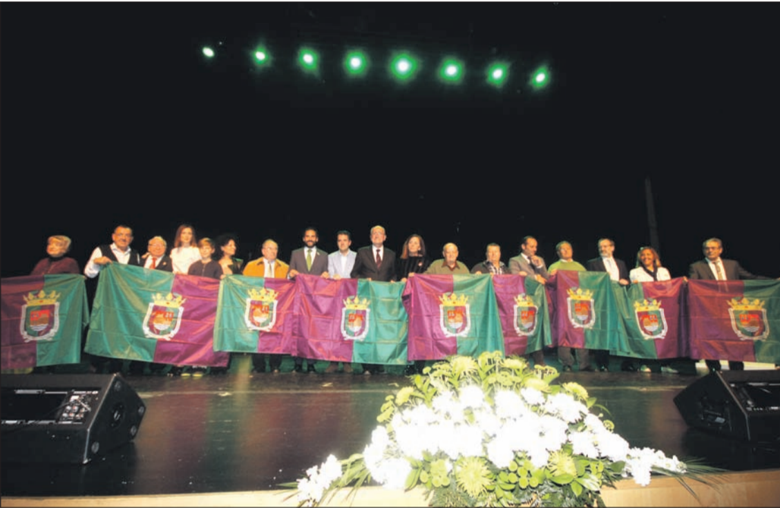
Entrega de banderas de la Ciudad de Málaga por parte del alcalde de la capital, Francisco de la Torre, y concejales.

Número 620 8 de Marzo de 2017 C/ Pedro Molina, 1 Tfno: 952 22 54 39 Fax: 952 21 48 82 E-mail: prensa@femape.com - la_alcazaba@hotmail.com Web: www.femape.com Edición digital: www.femape.com/laalcazabadigital Twitter: @FMPLaAlcazaba Búsquenos también en Facebook