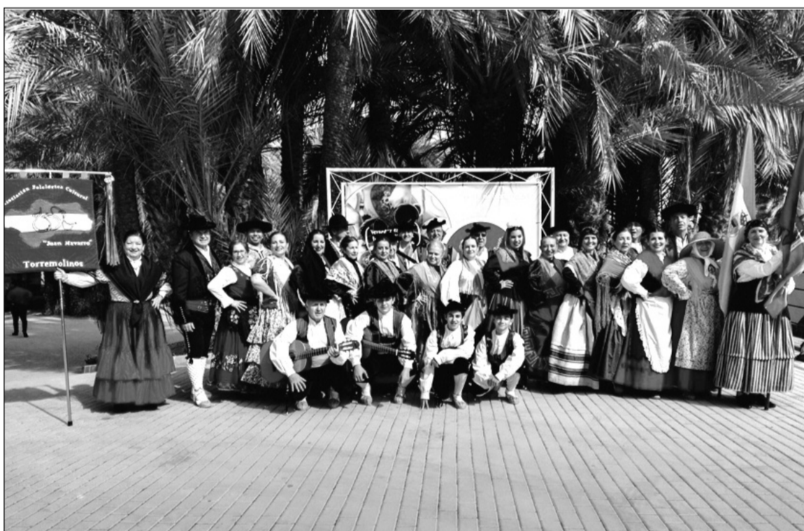
Integrantes de la Asociación en la localidad almeriense de Vera.