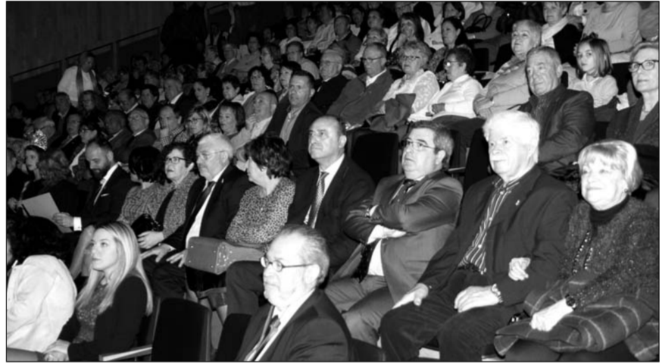
Los patrocinadores del colectivo peñista estuvieron presentes en el acto.