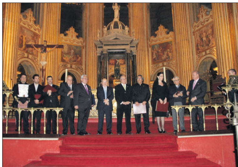
Entrega de recuerdos a los participantes en 'La Saeta, Oración Cantada'.