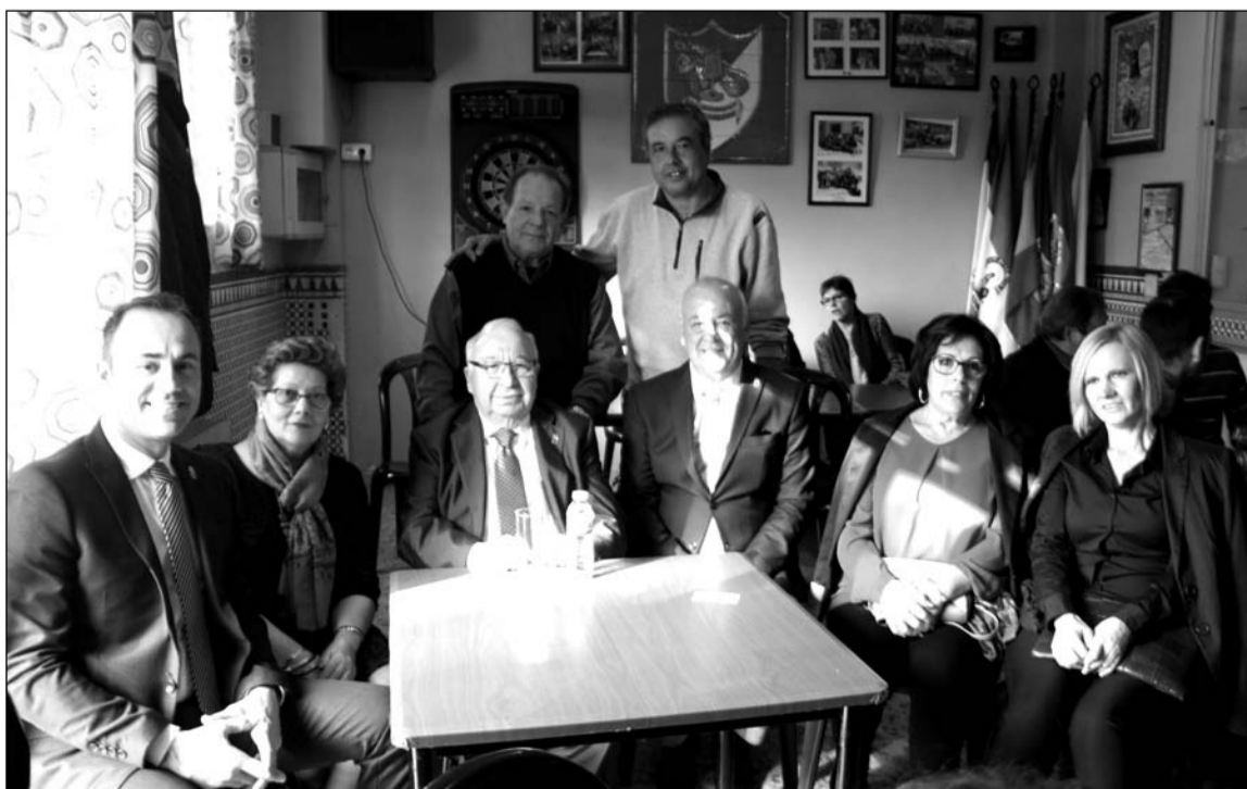
Visita de representantes de la Federación a la sede de la Peña La Solera.

La Peña La Solera celebraba el 28 de febrero el Día de Andalucía