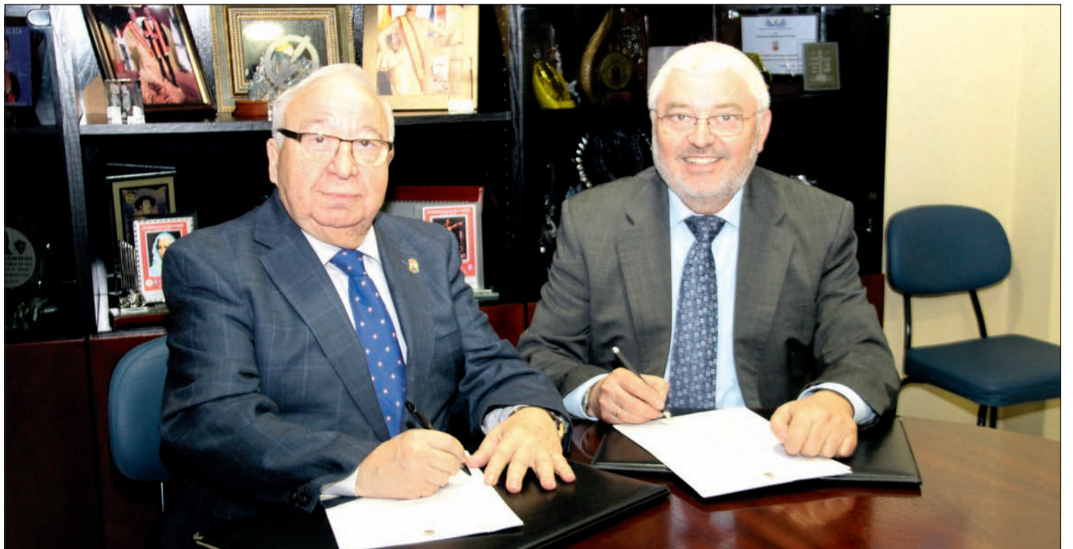
Firma del convenio de patrocinio de Cafés Santa Cristina a la Federación Malagueña de Peñas.