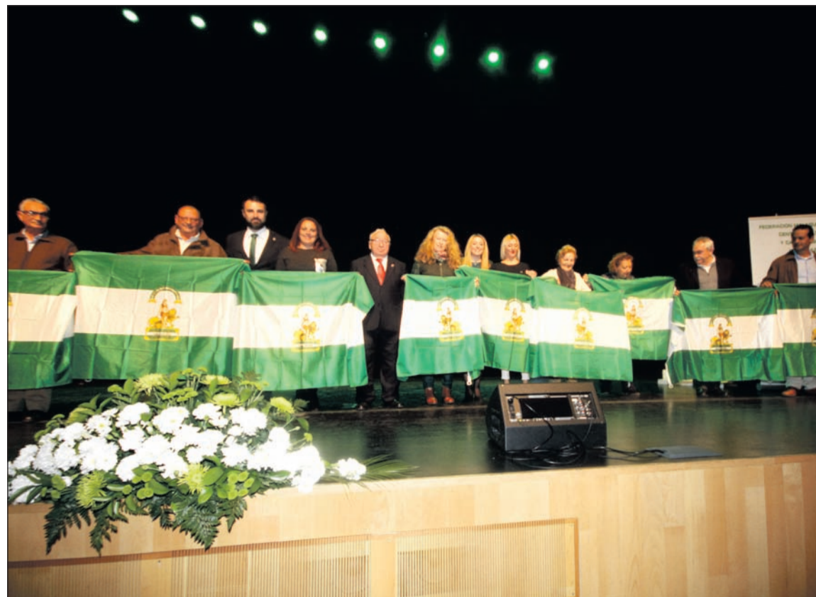
Entrega de banderas de Andalucía el 28 de febrero.

Cabrera para entregar las banderas blancas y verdes a las peñas Colonia Santa Inés, Los Corazones, Cortijo de Torre, Costa del Sol, Finca La Palma, Fosforito, Huertecilla Mañas, El Palustre, Santa Marta y la