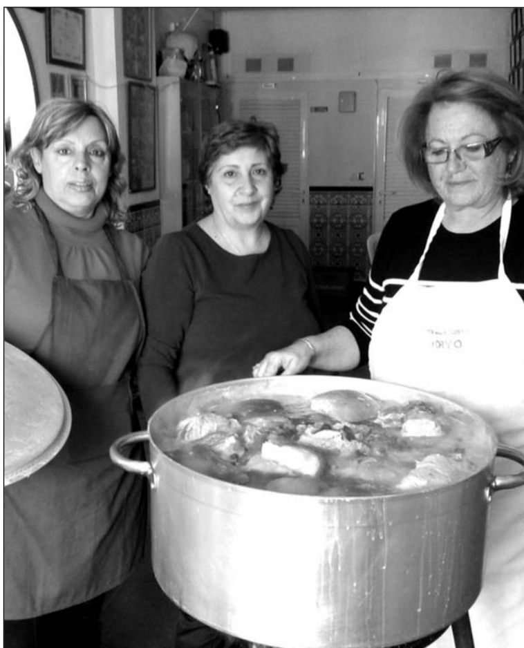
Socias encargadas de preparar la comida.