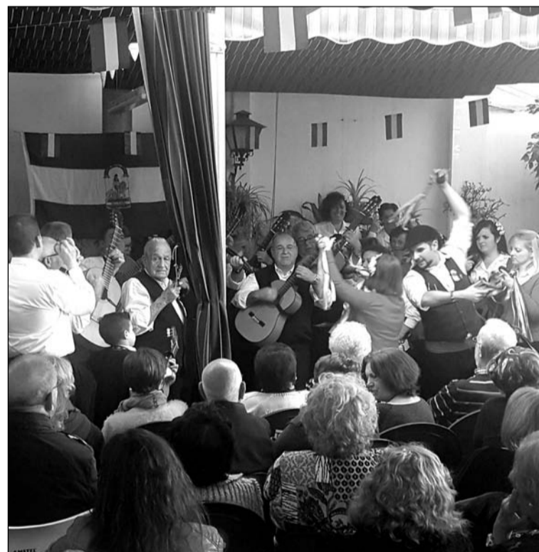
Baile de Verdiales en la terraza de la sede.