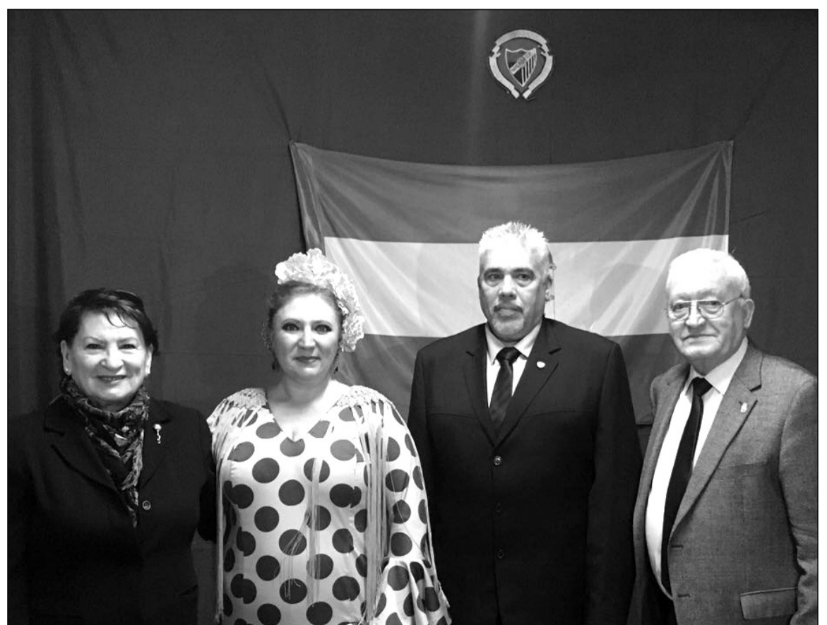
Acto del Día de Andalucía en la sede de la Peña Blanquiazul.

El próximo evento que organice esta entidad será una exaltación cofrade programada para el día 25 de marzo.