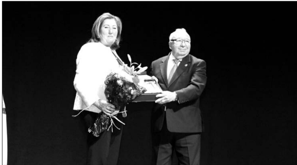
Agradecimiento a la Peña Santa Cristina por su colaboración en las Olimpiadas de Peñas.