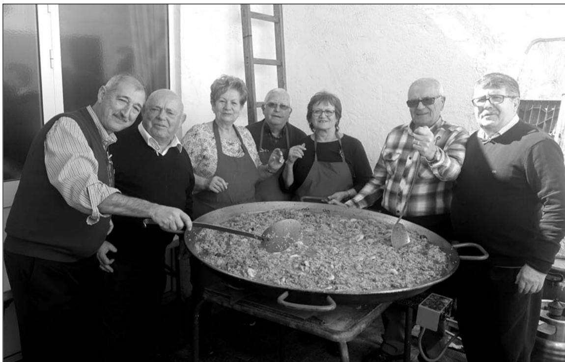
Preparativos de la paella que se degustó por el Día de Andalucía.