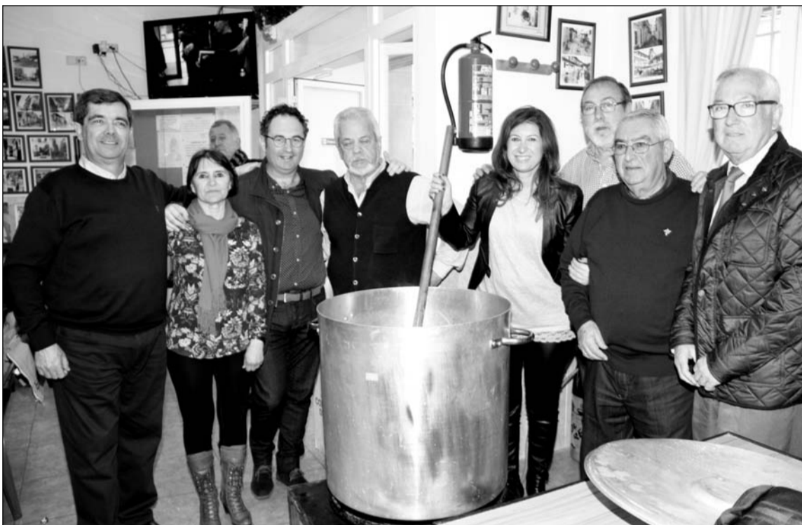
Asistentes ante la gran olla en la que se preparó la comida.

Durante el acto, que dará inicio a las 20:30 horas en el salón de actos de la Once, en calle Cuarteles, será descubierto el lienzo que dará pie al cartel anunciador, obra del pintor Salvador Campos Robles.