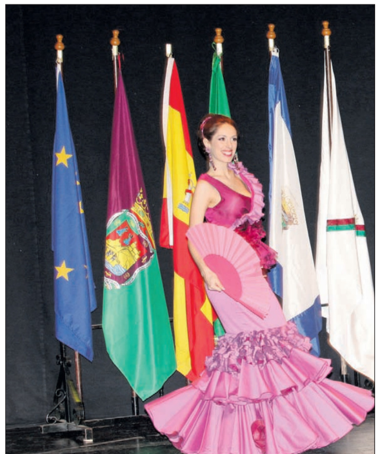
Una de las actuaciones musicales incluidas en el pregón.