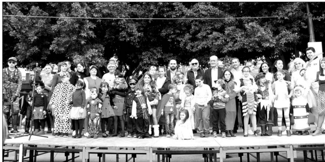
El Concurso de Disfraces tuvo una gran participación.

Desde la peña se instaló una barra para la comida, en una gran jornada festiva en la que se contaba con la presencia de diferentes autoridades, destacando la asistencia del alcalde de Málaga, Francisco de la Torre, que participó en el acto de entrega de premios a los mejores disfraces.