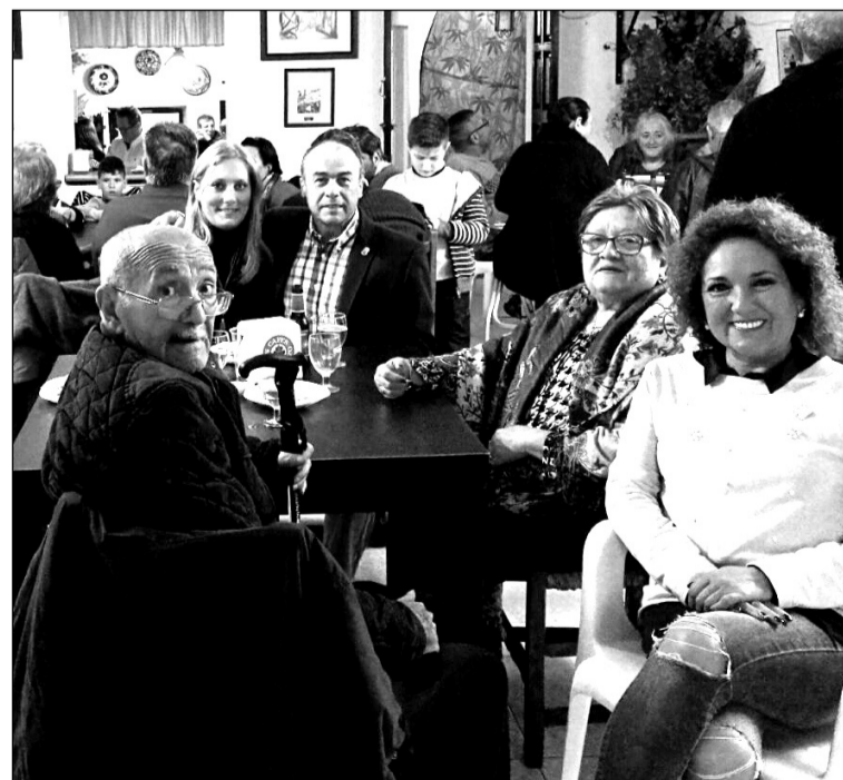
Una imagen de la comida de hermandad.

Entre las actividades que a lo largo del año realiza esta asociación se encuentran escuelas taller, un concurso de copla, una exaltación de la saeta, actos culturales y esta comida mensual.