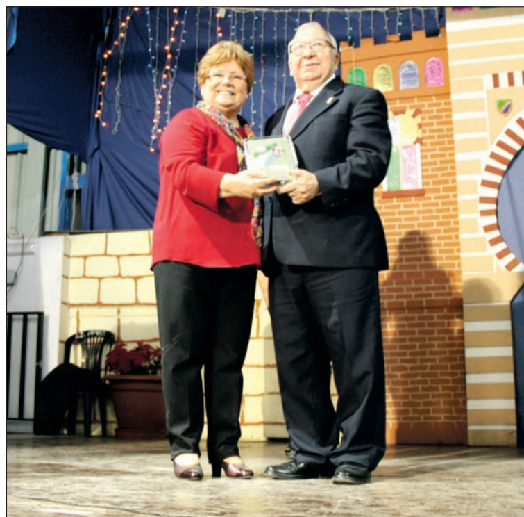
La Peña Los Corazones entrega un recuerdo a la Federación.