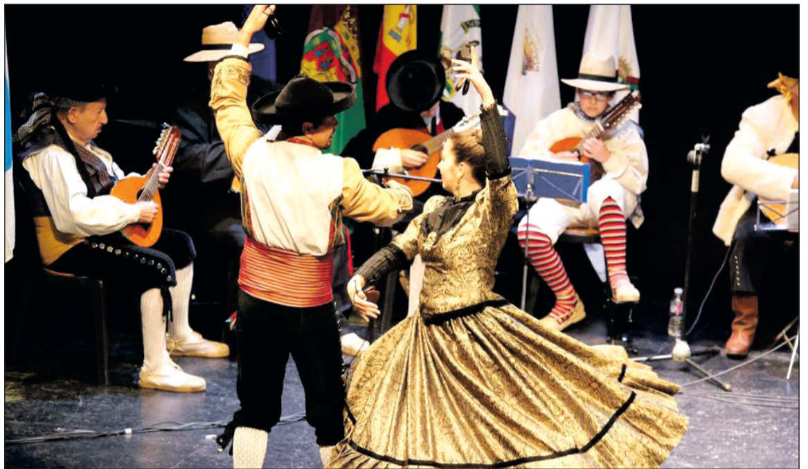
Un instante de la actuación de la Asociación Cultural Juan Navarro.

El programa incluía 'Francisco Alegre' de Quiroga, 'La Virgen de Bronce' de Soutullo y Vert, 'Granada' de Agustín Lara, 'Suite Andalucía, en la Feria' de Escobar, 'La Malagueña' de Ernesto Lecuona y 'Manolete' de Orozco González. Con el público en pie, se cerraba el acto con la interpretación de los himnos de Andalucía y España antes de acceder a un aperitivo para todos los asistentes.