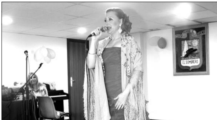
Actuación de Canción Española.