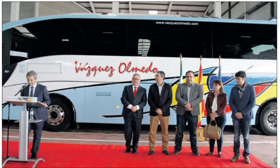
Presentación de las nuevas instalaciones de la empresa.