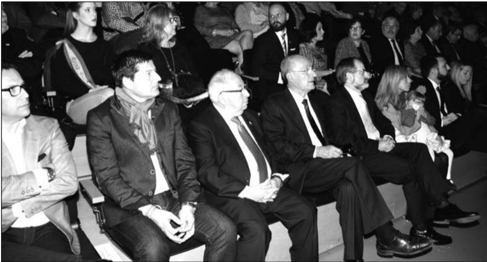
Autoridades y responsables de la Federación, atentos al pregón.