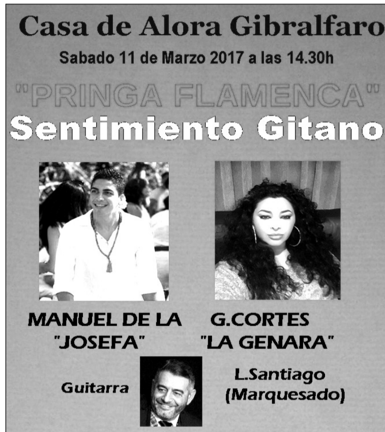
Cartel anunciador de esta actividad.