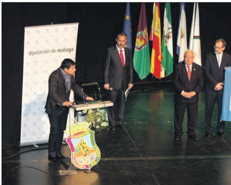
El diputado Francisco Javier Oblaré se dirige a los peñistas.