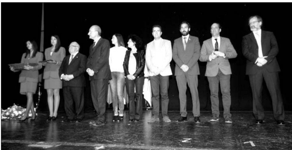
El alcalde, en el escenario acompañado por todos los concejales asistentes.