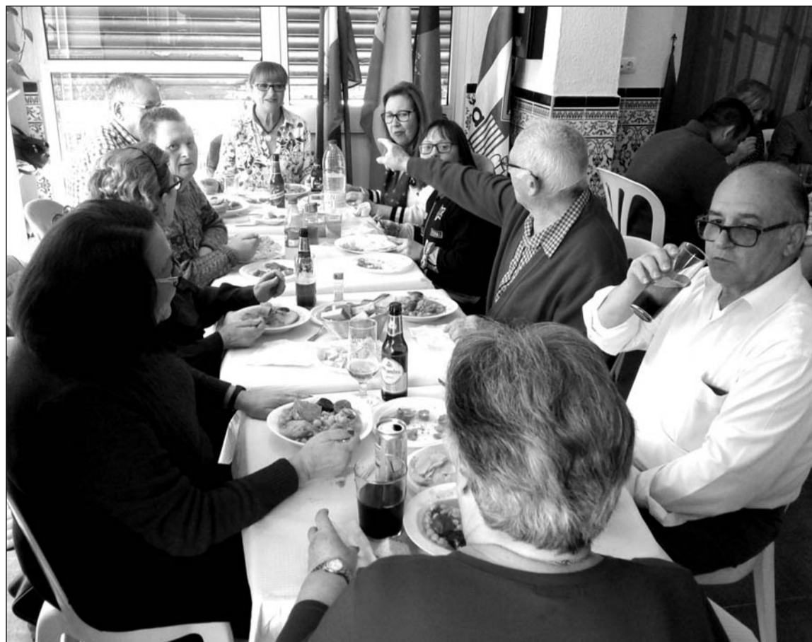
Un instante de la comida de hermandad del pasado mes de febrero.