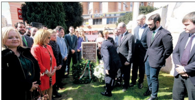
Ofrenda de la Federación Malagueña de Peñas.

El alcalde, Francisco de la Torre, presidía en la mañana del 28 de febrero el acto institucional del Día de Andalucía acompañado por miembros de la Corporación Municipal. En el acto, celebrado junto al monumento a Blas Infante, intervenía el decano del Colegio de Abogados, Francisco Javier Lara. La Federación Malagueña de Peñas se unió al acto con la entrega de una canastilla de flores.