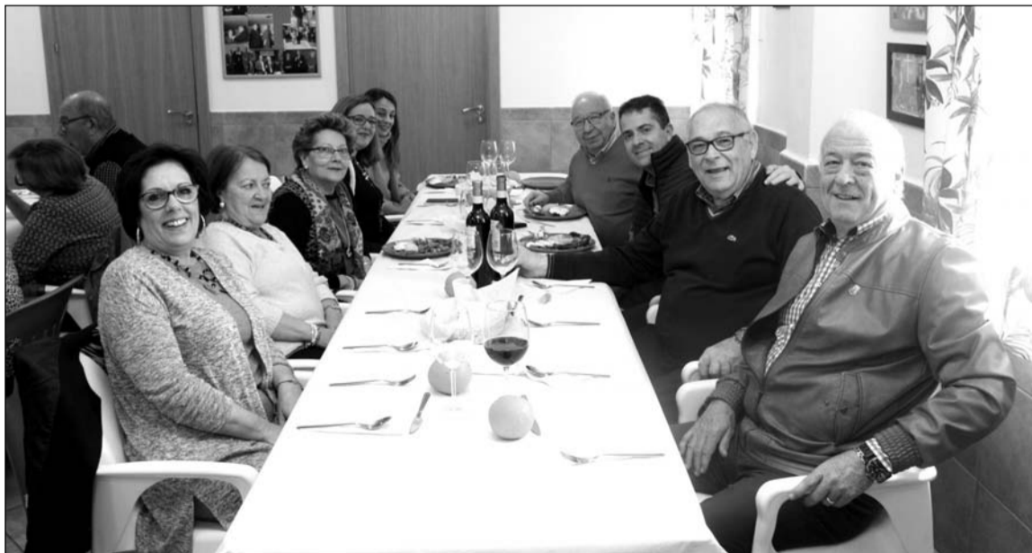
Imagen de la comida de hermandad del pasado 26 de febrero.