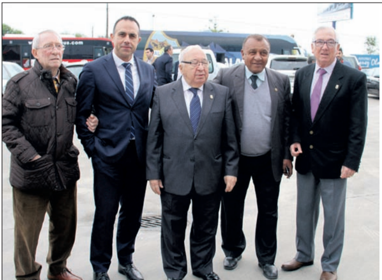
El Málaga C.F. también estuvo representado en el acto.