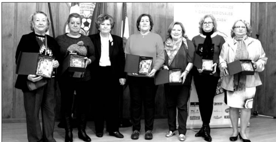
Ganadoras de trofeos tras la disputa de las Olimpiadas.