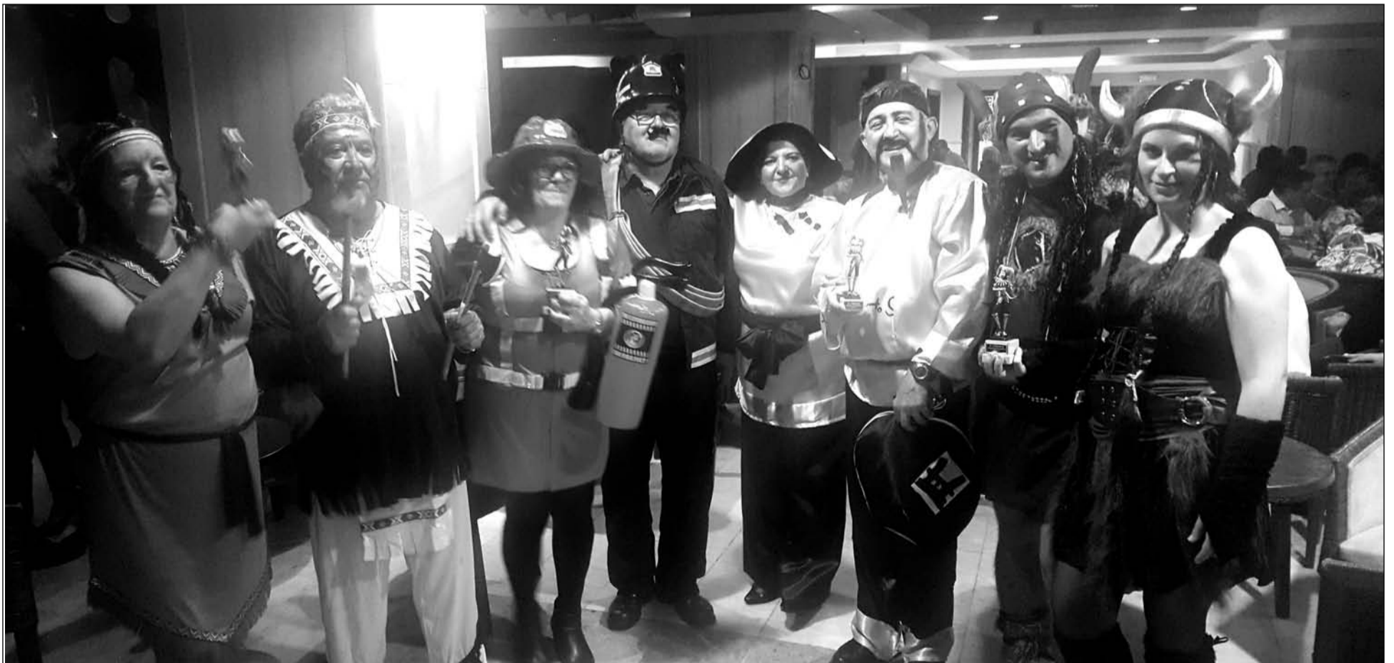
Socios de la Agrupación Cultural Telefónica, disfrazados por el Carnaval.