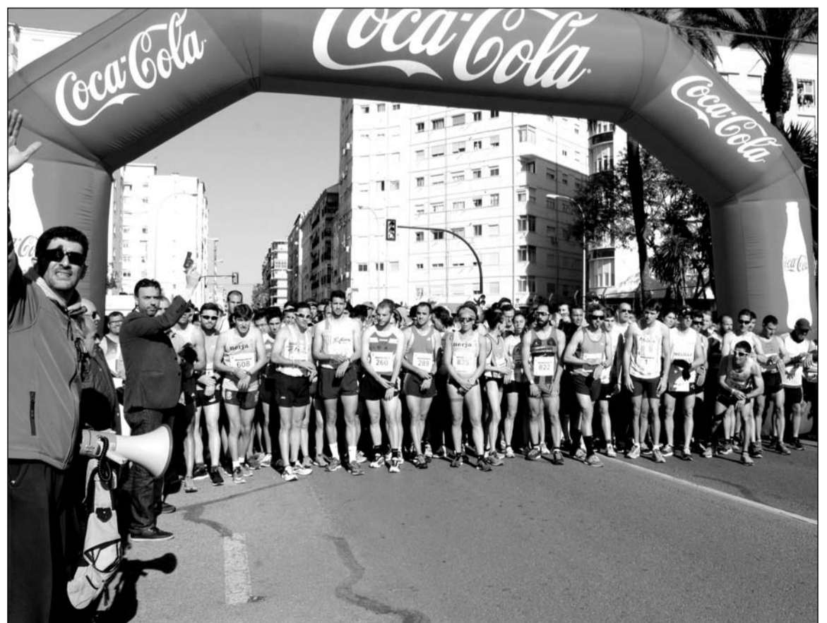
Salida de la prueba en su edición del pasado año.

Paralelamente, desde finales del pasado mes de enero, esta entidad perteneciente a la Federación Malagueña de Peñas, Centros Culturales y Casas Regionales 'La Alcazaba' está celebrando unos torneos internos de parchís y chinchón para sus socios.