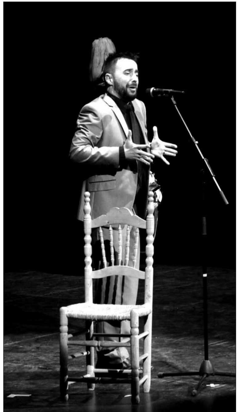
Final del concurso del pasado año.

La gran final, por su parte, se desarrollará el 2 de abril a las 19 horas en la Teatro Cervantes de nuestra capital, con la entrega también de distinciones como las Torres de San Pablo.