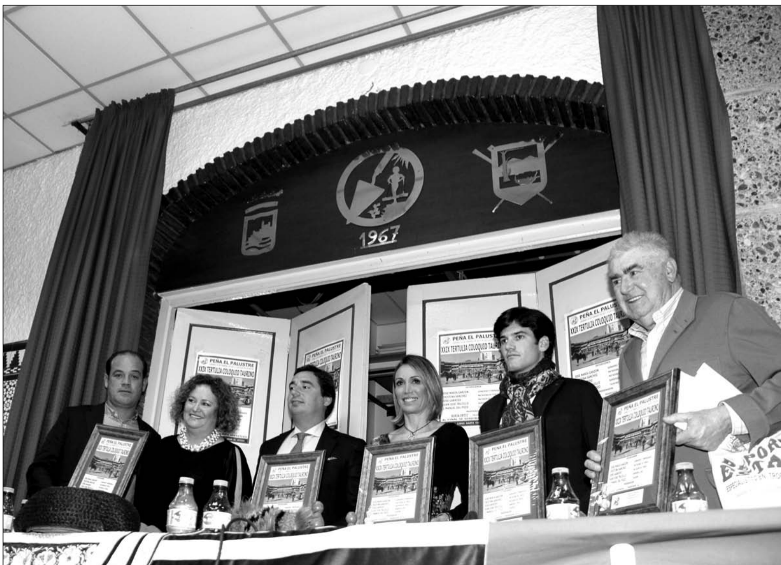
La presidenta hace entrega de unos recuerdos a los intervinientes en la mesa.