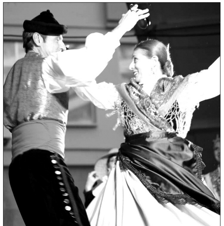
Imagen de archivo de la asociación.

Esta actividad es la segunda vez que se realiza, y está programada para los días 25 y 26 de marzo. El primero de los días habrá sesión doble de 11:00 a 13:30 y 17:00 a 19:00 horas; mientras que en la segunda será sólo en horario matinal de 11:00 a 13:00. La masterclass tiene un precio de 60 euros por persona, siendo las plazas limitadas. Se puede obtener más información en el teléfono 659 660 916, en el correo electrónico asociacion-juannavarro@hotmail.com, o en la página web www.juannavarro.es .