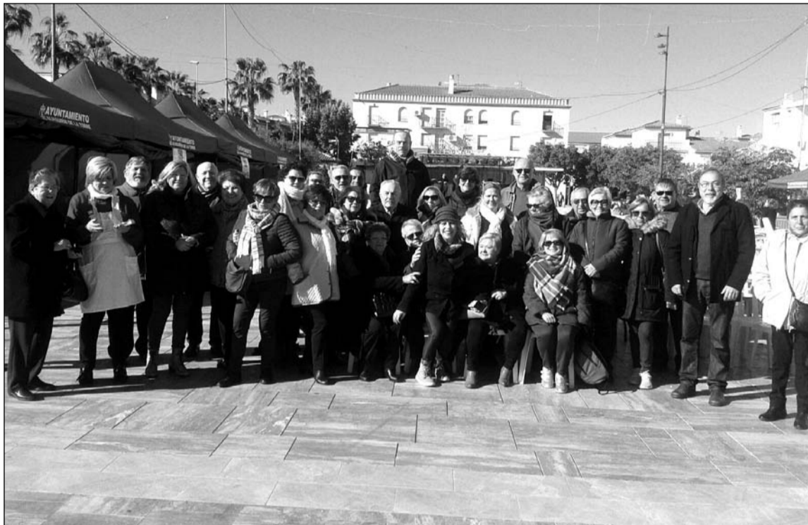
Socios de la Peña Perchelera en Alhaurín de la Torre durante las Fiestas de San Sebastián.

dante actividad en las últimas semanas, entre las que se encuentra la comida de socios del pasado 4 de febrero, a la que asistieron diversos directivos del colectivo peñístico; así como una visita a la localidad de Alhaurín de la Torre, atendiendo a la invitación cursada por su Ayuntamiento con motivo de las Fiestas de San Sebastián.