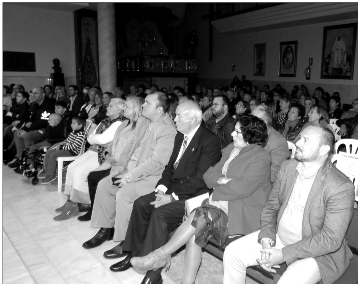
El salón de actos de la Casa Hermandad se llenó para este acto benéfico.