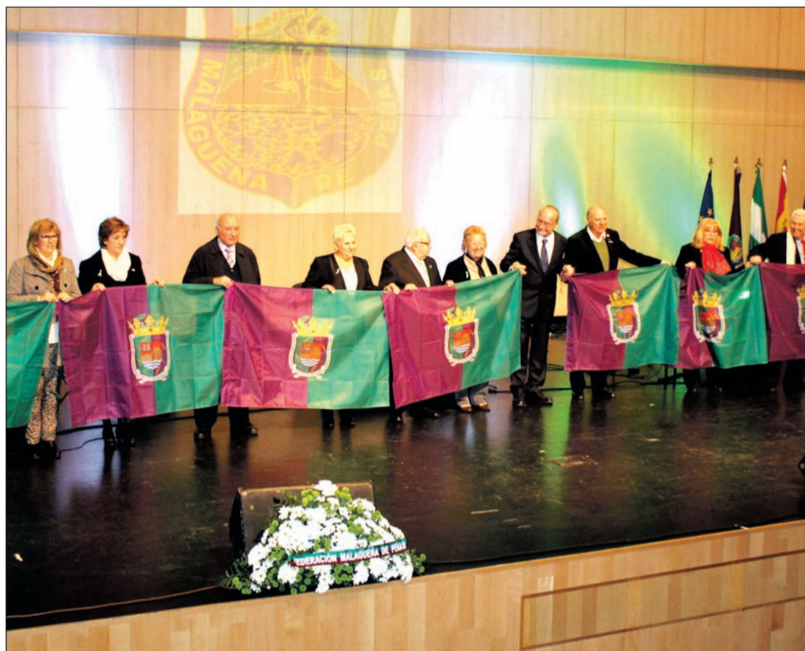
Entrega de banderas de la provincia de Málaga el 28 de febrero de 2016.