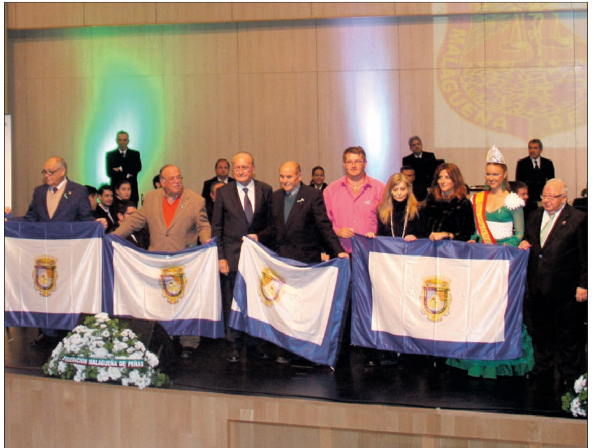
El alcalde Francisco de la Torre, haciendo entrega de banderas del Ayuntamiento el pasado año.