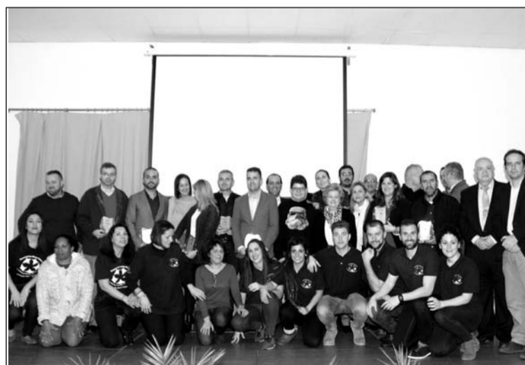
Galardonados, autoridades y miembros de la asociación.

Además de atender todas y cada una de las peticiones realizadas, este año ha participado casi en la totalidad de los eventos organizados por la asociación además de ofrecer una charla a los adolescentes en una