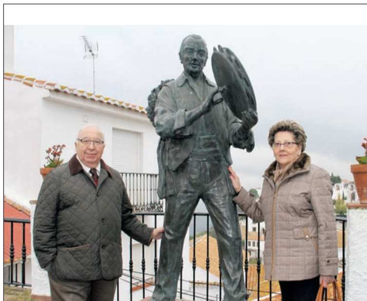
El presidente Miguel Carmona y su esposa ante el monumento a los verdiales.