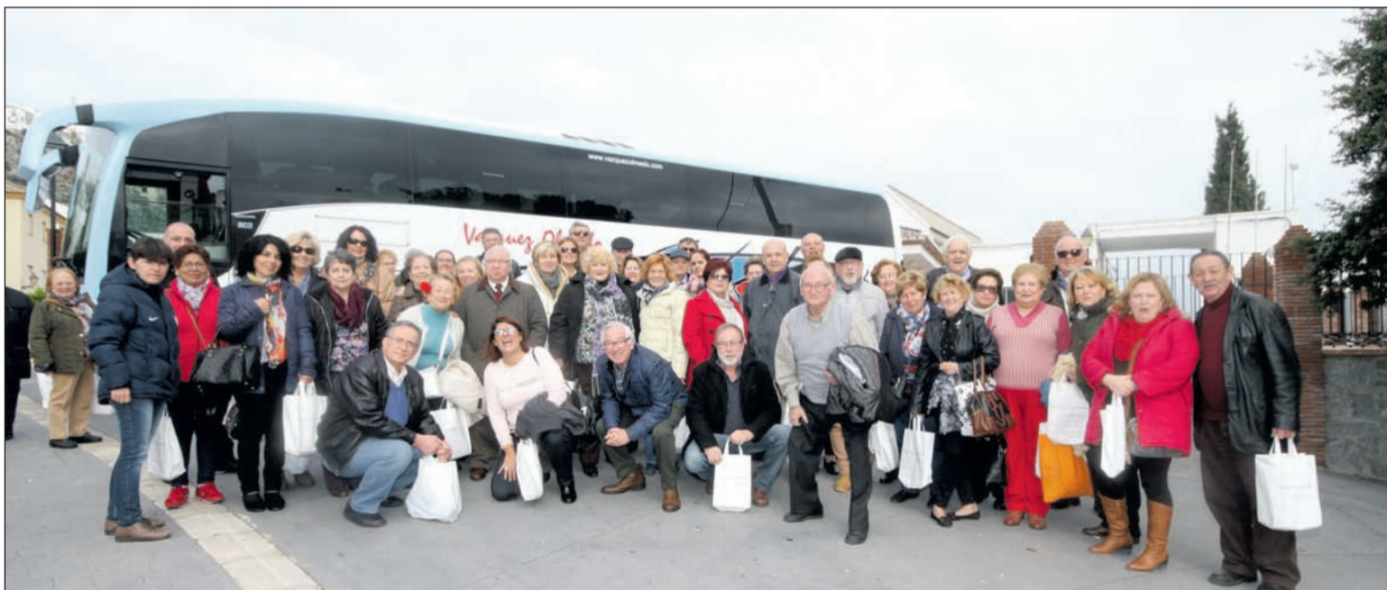
Grupo de peñas que participaron en la excursión a Comares del pasado 17 de febrero.

Los presidentes y representantes de las entidades federadas pudieron conocer también la gastronomía del lugar con un almuerzo servido en uno de sus restaurantes.