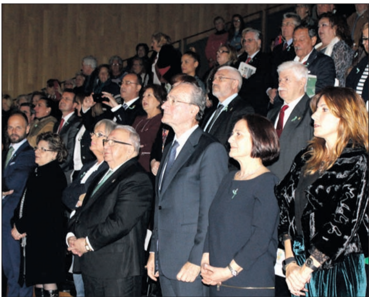
Interpretación del Himno de Andalucía el pasado año.