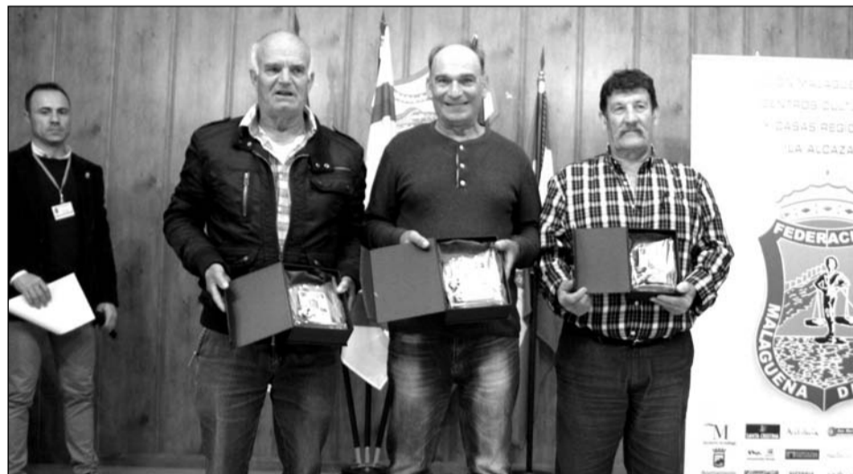
Entrega de trofeos de Ranas.