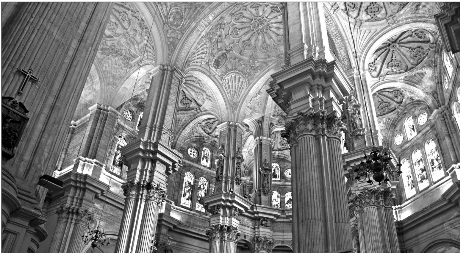
Interior de la Catedral de Málaga, donde se celebrará este acto de exaltación a la saeta.