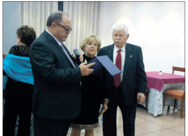
Acto de entrega de reconocimientos.