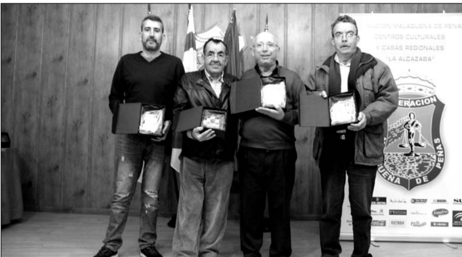
Entrega de trofeos de Parchís.