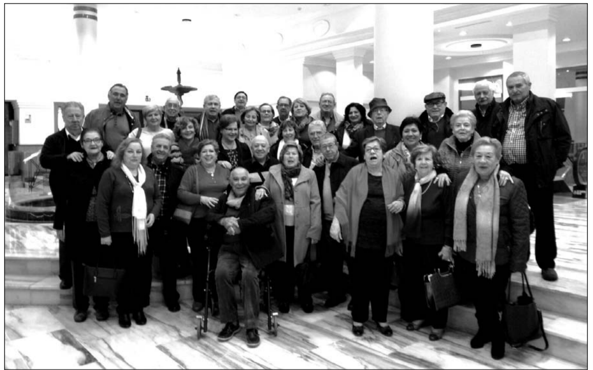
Socios en la celebración de San Valentín en el hotel Torrequebrada.