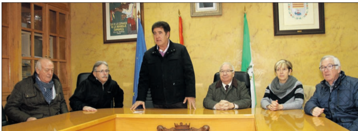
Recepción con el alcalde de Comares.