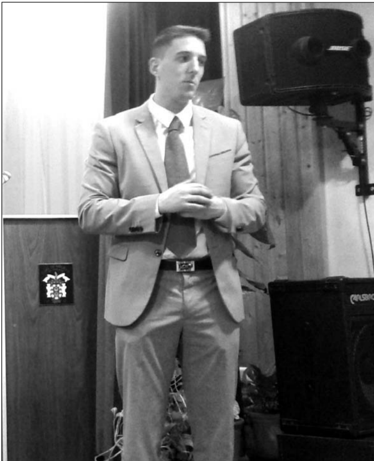
Un instante de la conferencia.