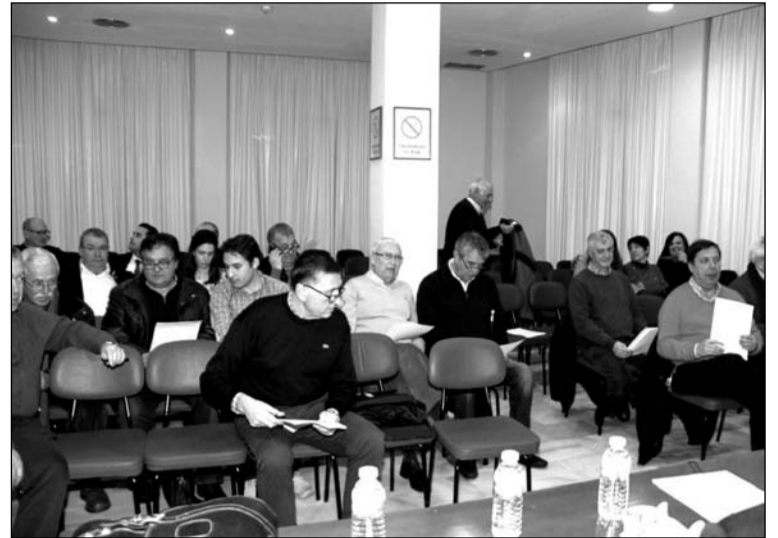
Vista general del salón de actos de la Federación al inicio de la asamblea.