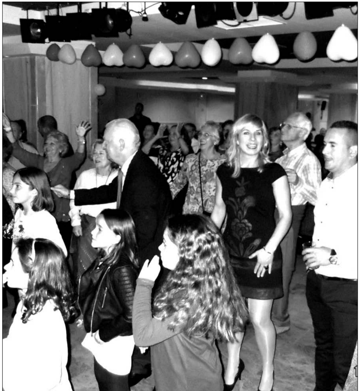
Ambiente durante la fiesta de San Valentín.

Un fin de semana plétórico de alegría y 'pasión' que invita a preparar el siguiente.