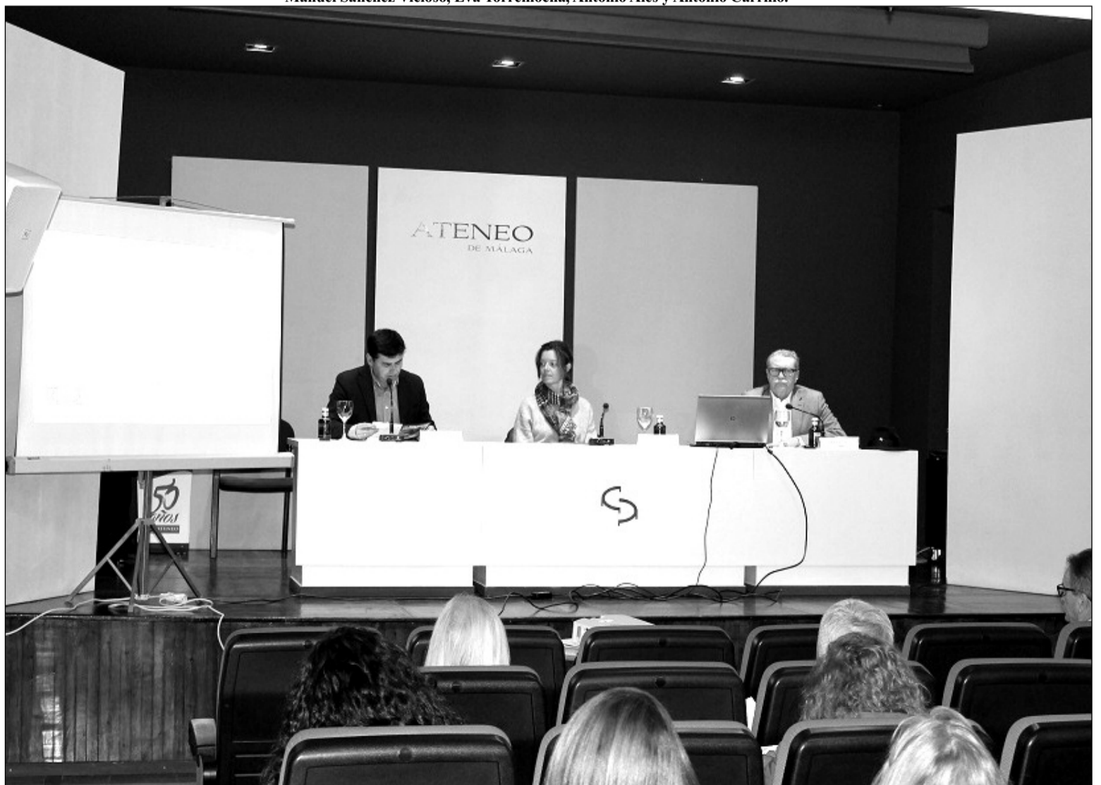
Un instante de la charla ofrecida en el Ateneo.