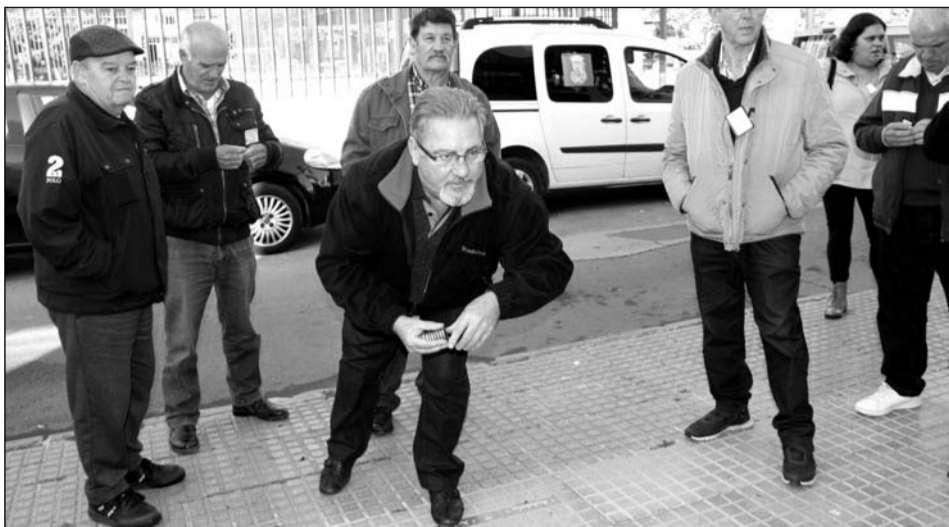
Lanzamiento a la Rana en un instante de la competición.