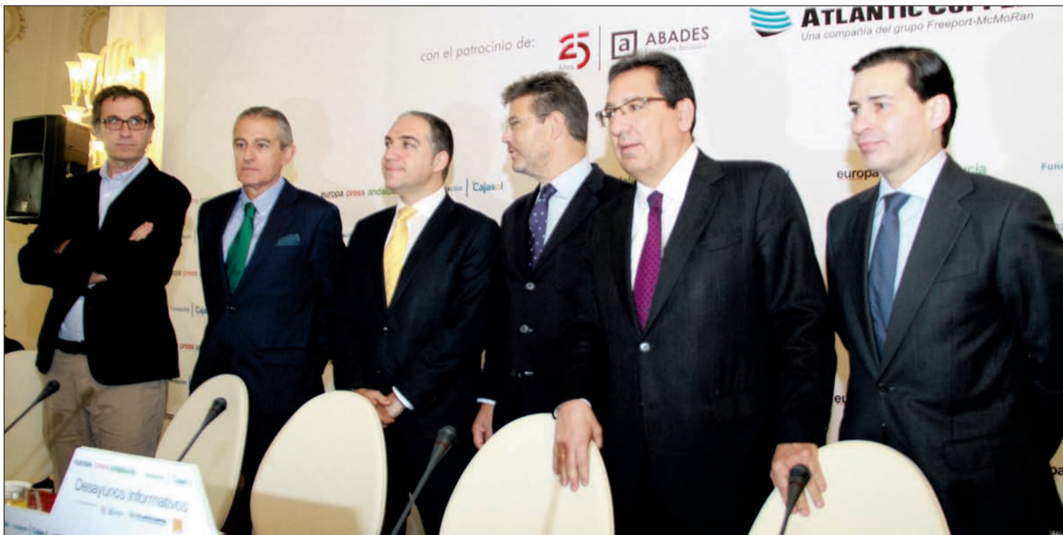
Participantes en el desayuno informativo celebrado en el Hotel Miramar.