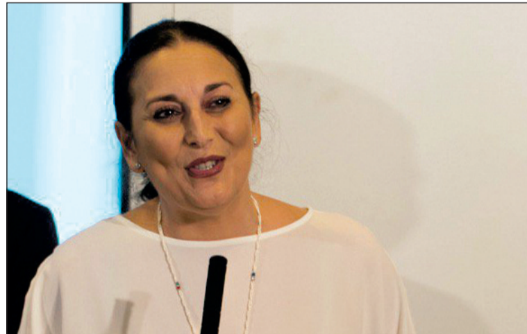
La Lupi será la encargada de inaugurar esta quinta edición.