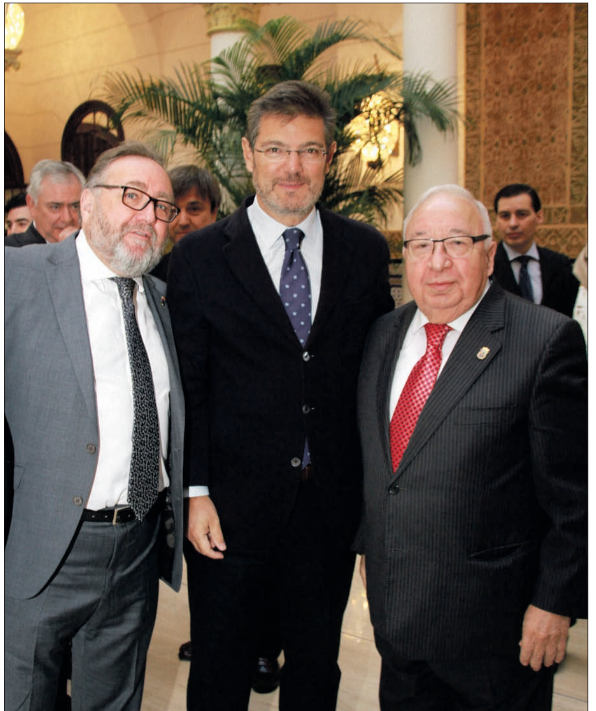
El alcalde de Alhaurín de la Torre, el Ministro de Justicia y el presidente de la Federación Malagueña de Peñas..