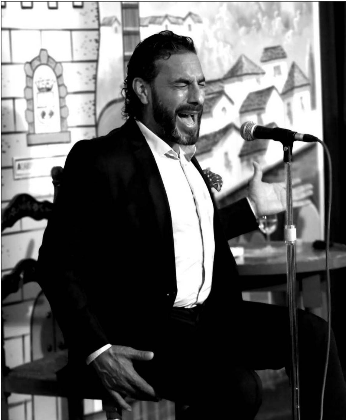
El cantaor Pedro El Granaino ofreció una gran actuación en la Casa de Álora.