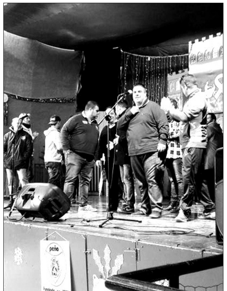
Los grupos de carnaval colaboraron en la lucha contra el cáncer infantil.