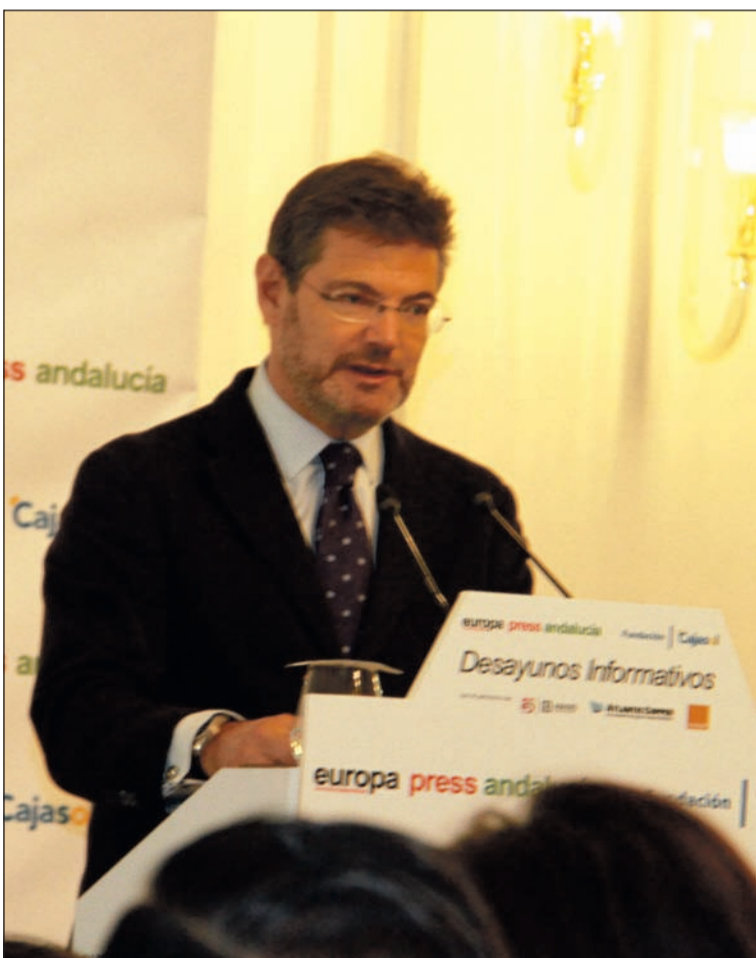
El ministro Rafael Catalá, durante su presentación de Bendodo.