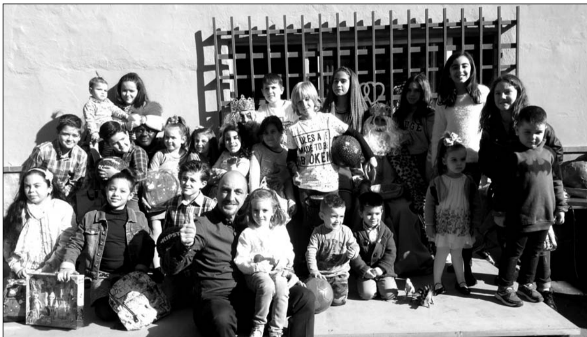
Los Reyes Magos entregan sus regalos a los más pequeños.