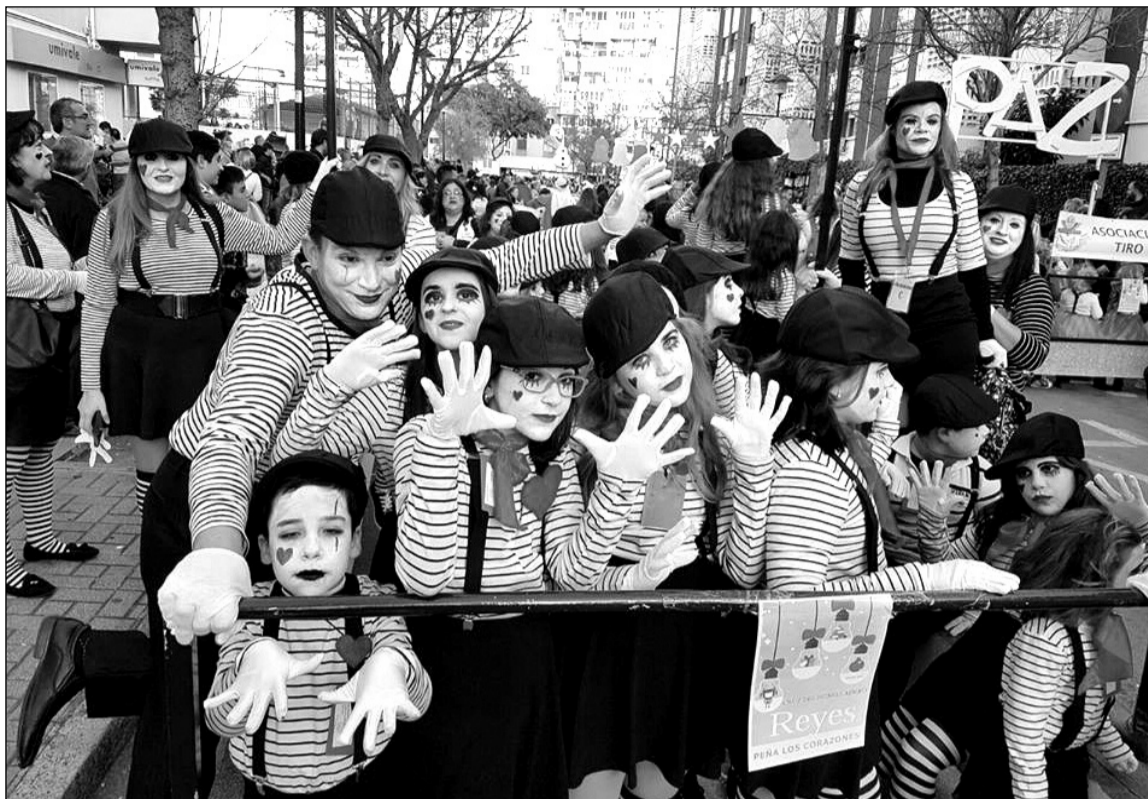
Niños de la Peña Los Corazones en la cabalgada de los Reyes Magos en Cruz de Humilladero.