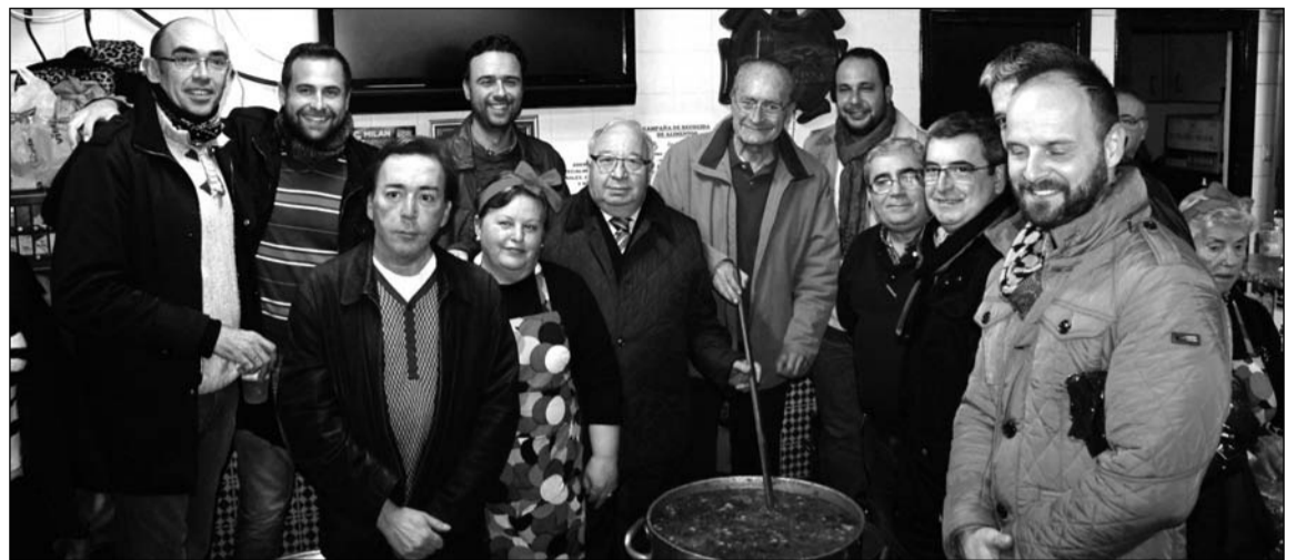
Preparativos de la Berza en una edición anterior.

La actividad tiene previsto su inicio a las 13 horas, y antecederá a las restantes fiestas de Las Previas como serán el Pico de Carnaval de Ciudad Jardín del 4 de febrero, los Callos de Humildad y Paciencia nuevamente en Cruz de Humilladero el día 5, la Paella Carnavalesca de Palma Palmilla el 11 de febrero y finalmente a la jornada siguiente el tradicional Potaje Perchelero.