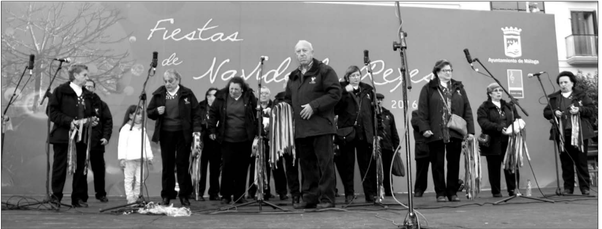
Las Pastoral de la Peña El Parral en el escenario de la plaza de la Constitución durante el Pasacalles del XIX Encuentro de la Federación de Peñas.

Finalmente, desde la actual gestora se quiere comunicar que se ha organizado un fin de semana para compartir con motivo del Día de los Enamorados en las jornadas del 11 y 12 de febrero.