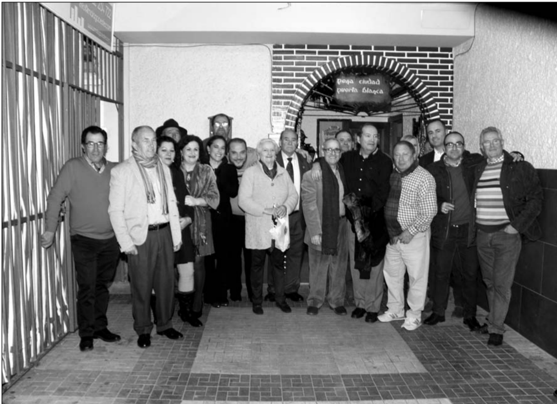
Artistas flamenco, componentes de la entidad e invitados en la puerta de la sede el 14 de enero.