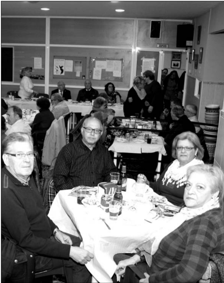
Socios disfrutan de su comida de hermandad.