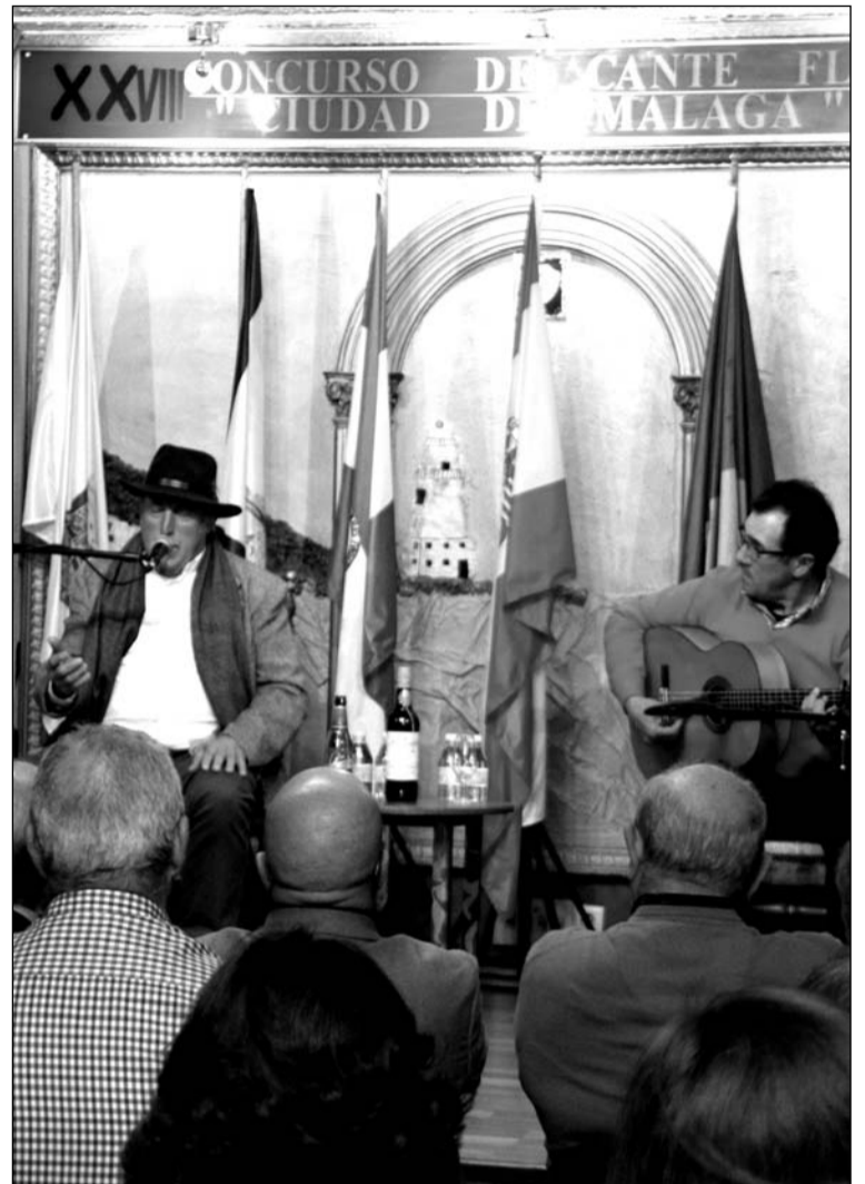
Uno de los cantaores participantes.