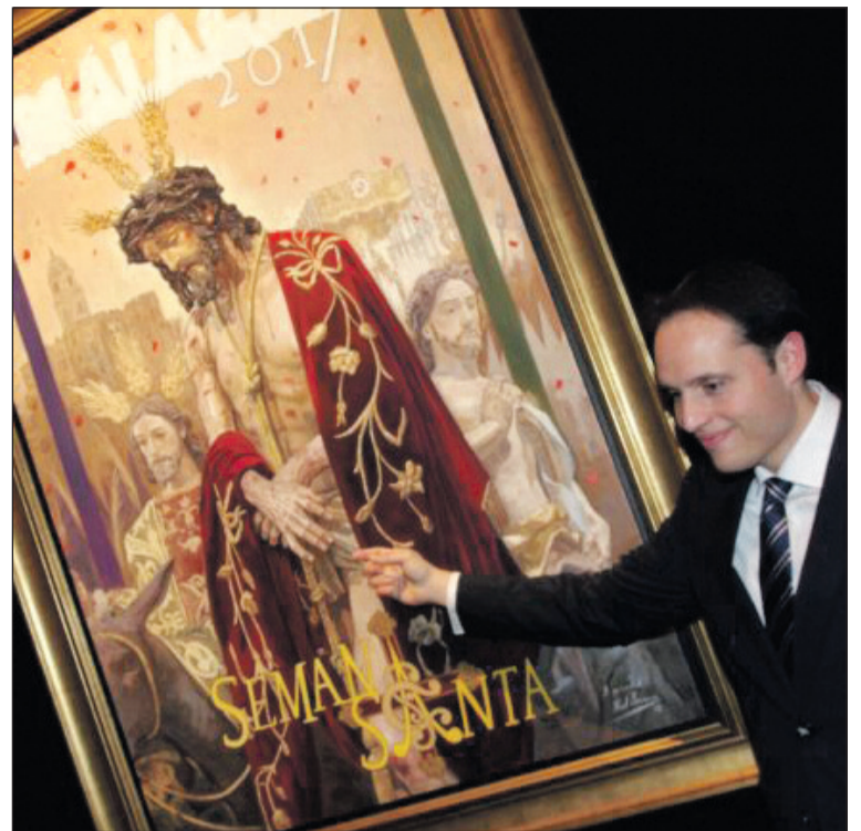
El autor muestra un detalle de su obra