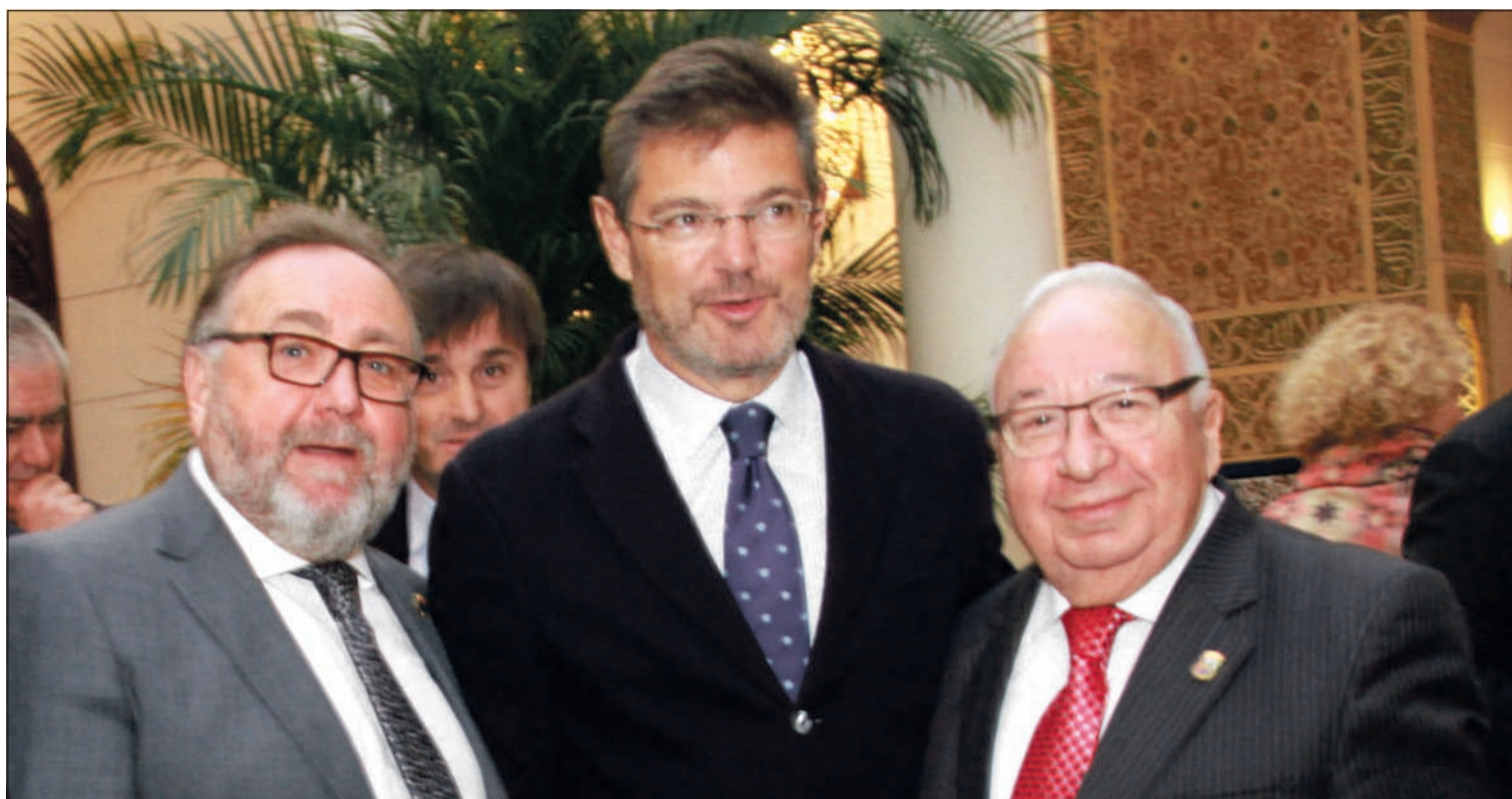
El alcalde de Alhaurín Joaquín Villanova, el ministro Rafael Catalá y el presidente de la Federación Miguel Carmona.

Número 617 25 de Enero de 2017 C/ Pedro Molina, 1 Tfno: 952 22 54 39 Fax: 952 21 48 82 E-mail: prensa@femape.com - la_alcazaba@hotmail.com Web: www.femape.com Edición digital: www.femape.com/laalcazabadigital Twitter: @FMPLaAlcazaba Facebook: www.facebook.com/FMPLaAlcazaba