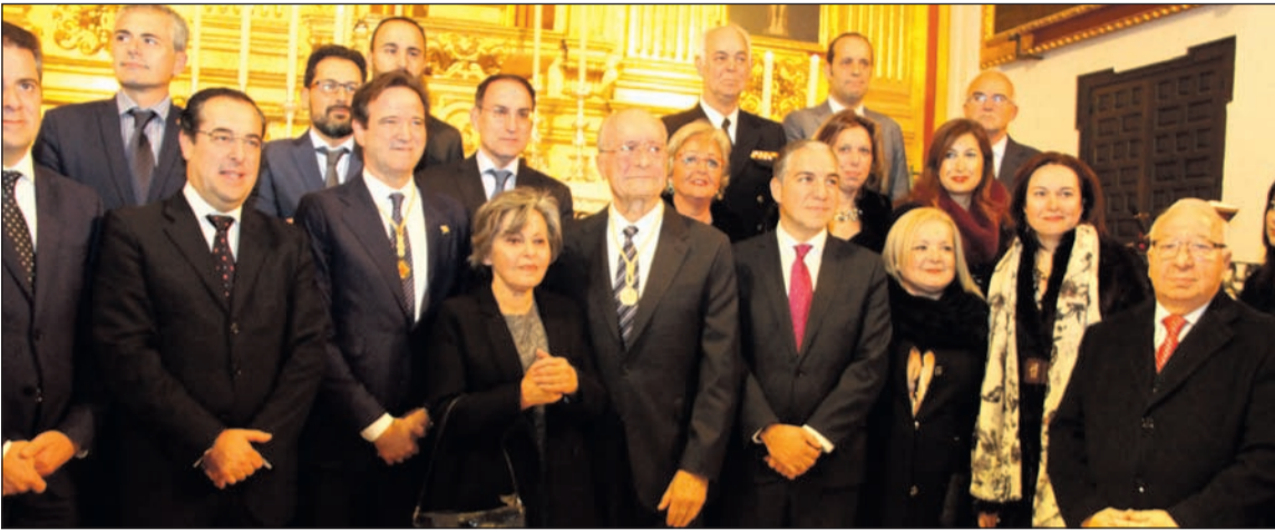
El presidente de la Federación, a la derecha, con el alcalde y algunas de las autoridades asistentes.