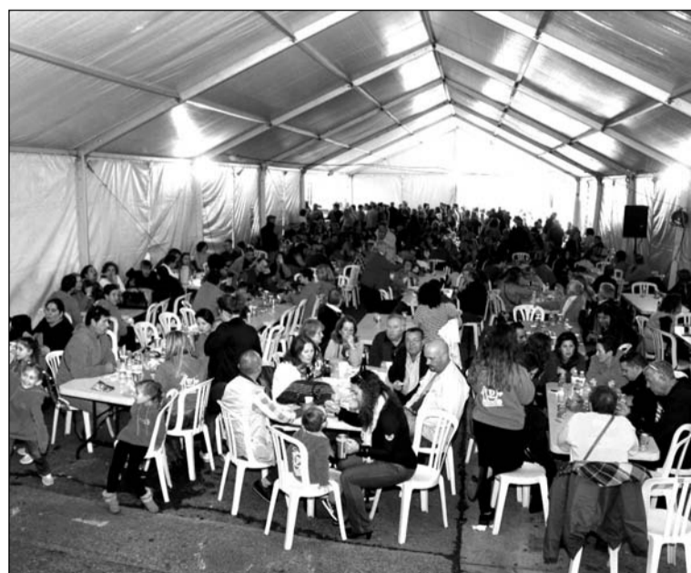
Ambiente en la carpa donde se celebra la actividad.