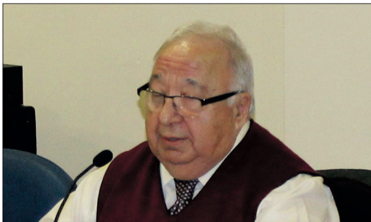
El presidente, en una asamblea anterior.