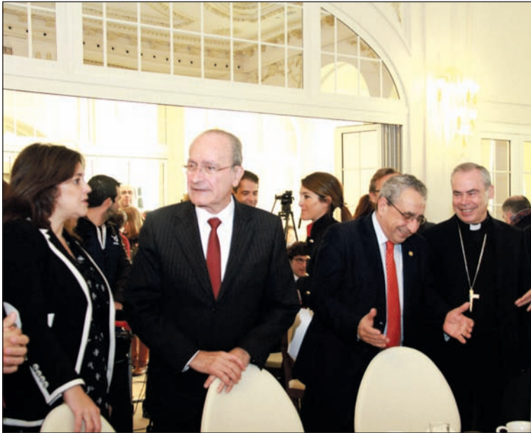
El alcalde y el obispo se encontraban entre los asistentes.

persona “comprometida” y un profesional, al tiempo que ha destacado que lleva “muchos años” ejerciendo y practicando la nueva política de la que se habla ahora. Además, aseguró que tiene a Málaga en la cabeza “las 24 horas del día”.