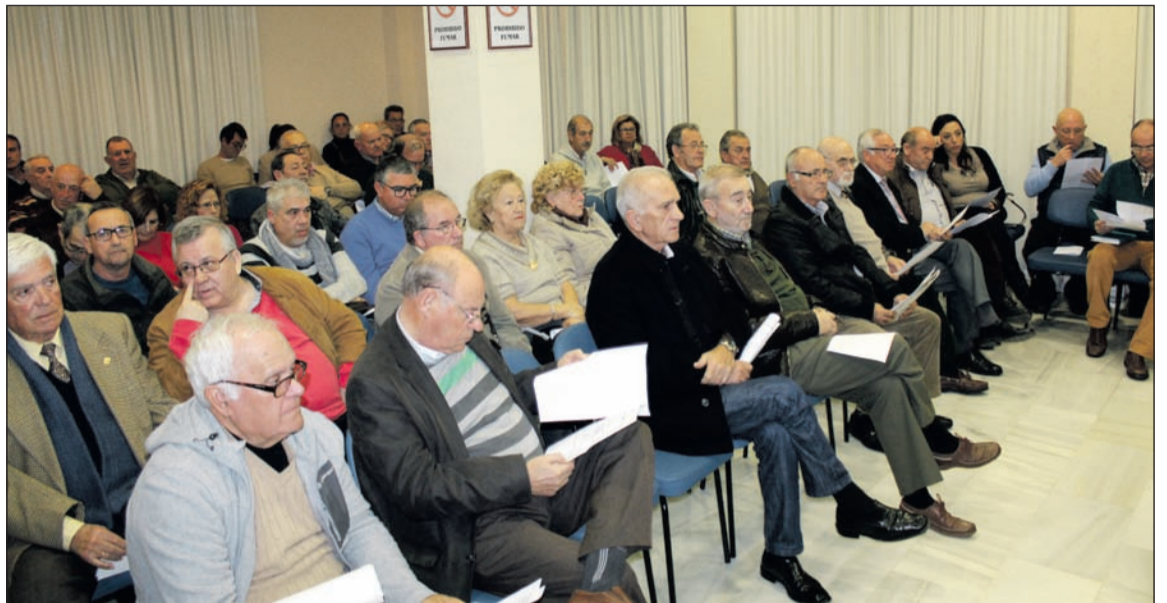
Presidentes y representantes de entidades en una asamblea del pasado año.

Además, es tradicional en este acto que se proceda al sorteo de banderas para el Día de Andalucía, el primer gran acto que organiza cada año la Federación Malagueña de Peñas y que, como es tradicional, se desarrollará en la mañana del 28 de febrero con la entrega de enseñas de Andalucía, Málaga y la provincia entre las entidades que componen este colectivo.