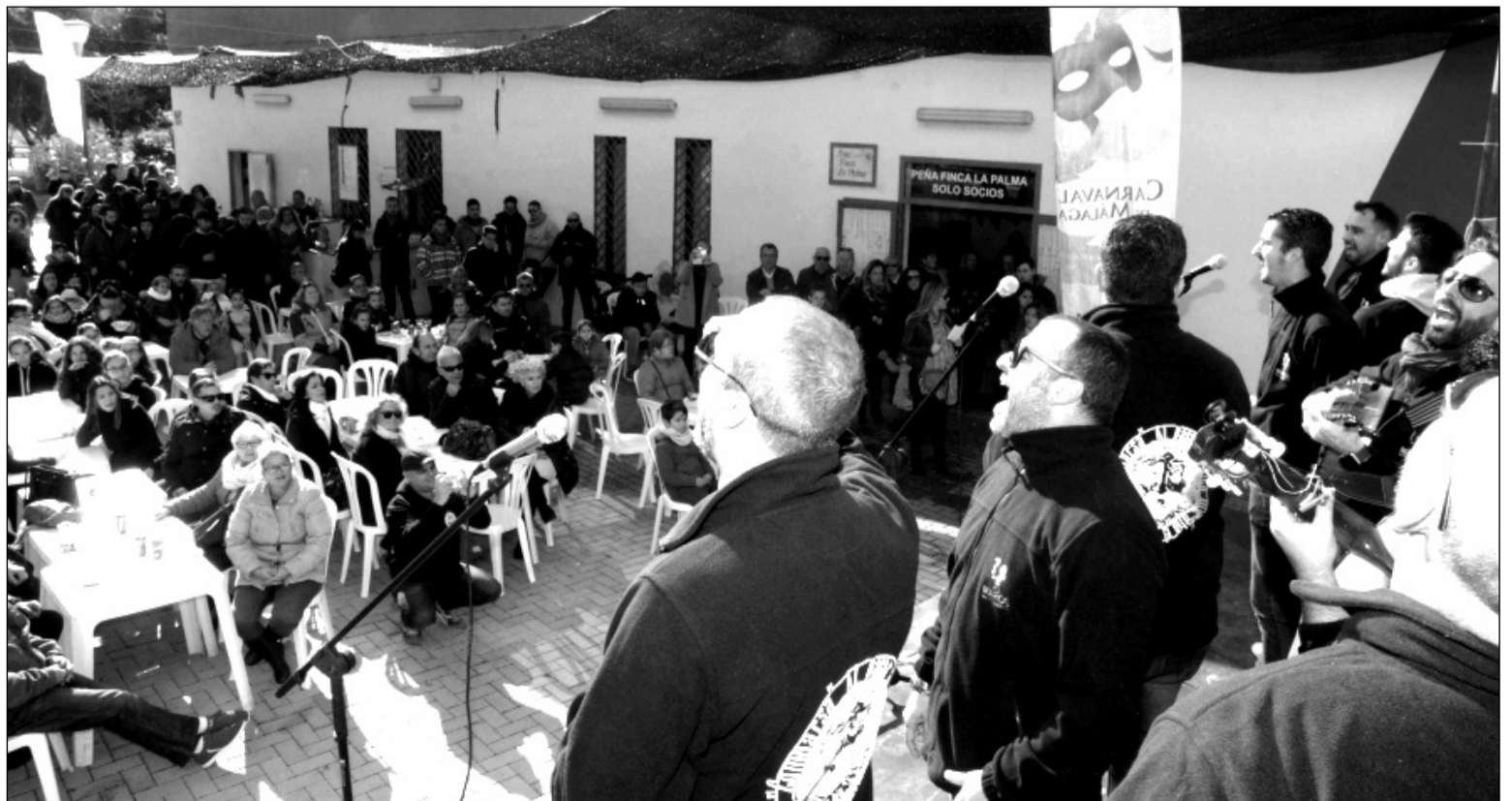
Una de las agrupaciones que actuaron en el exterior de la sede de la Peña Finca La Palma.