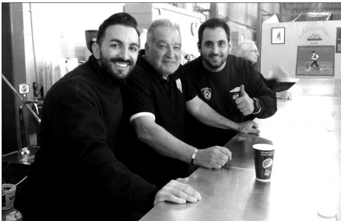
Componentes de la Peña El Duro atendieron la barra.