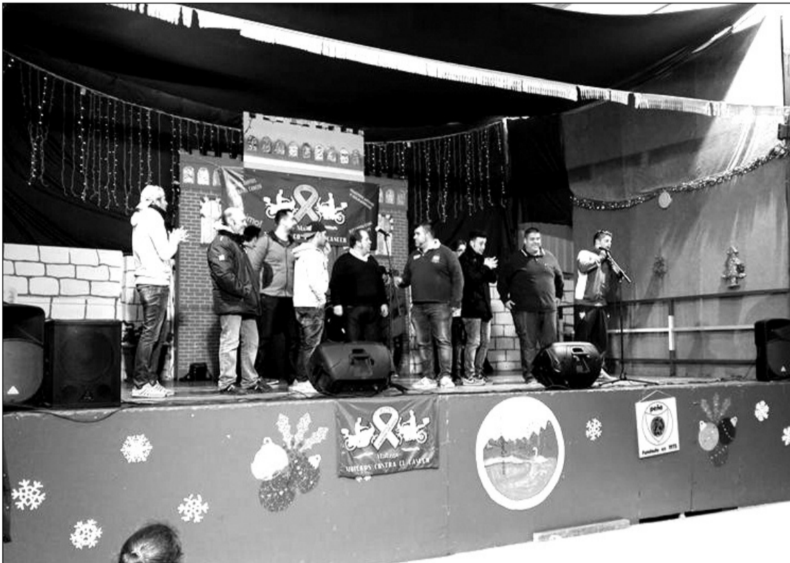
Uno de los grupos participantes sobre el escenario.