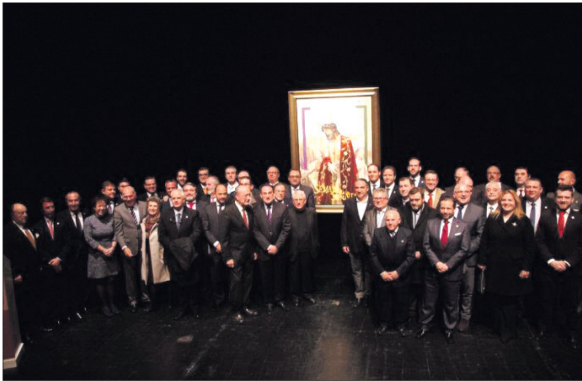
Miembros de la Agrupación de Cofradías con las autoridades e invitados asistentes al acto.