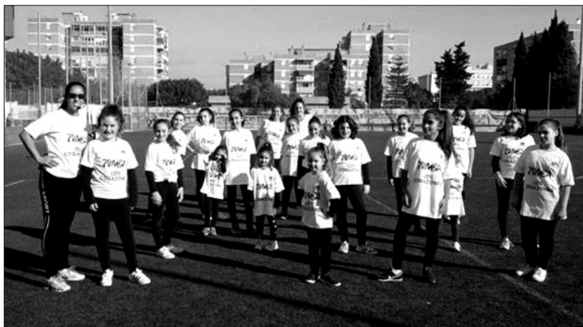
Componentes del equipo de Zumba de la entidad.