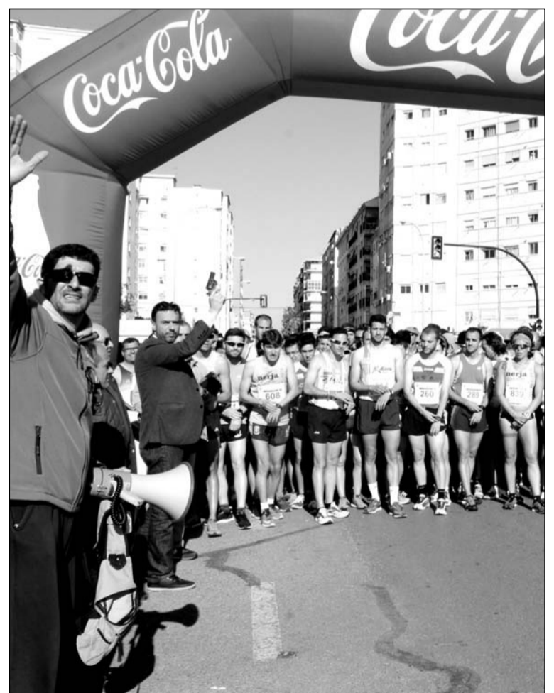
Salida de la Minimarató en 2016.

Con esta presentación que ya se prepara se dará el pistoletazo de salida a una de las pruebas atléticas más tradicionales de nuestra capital, y que cuenta con la principal característica diferenciadora con respecto a otras carreras en el hecho de tener su línea de meta en el castillo de Gibralfaro, con una importante subida en los últimos compases que añade un plus de dureza.