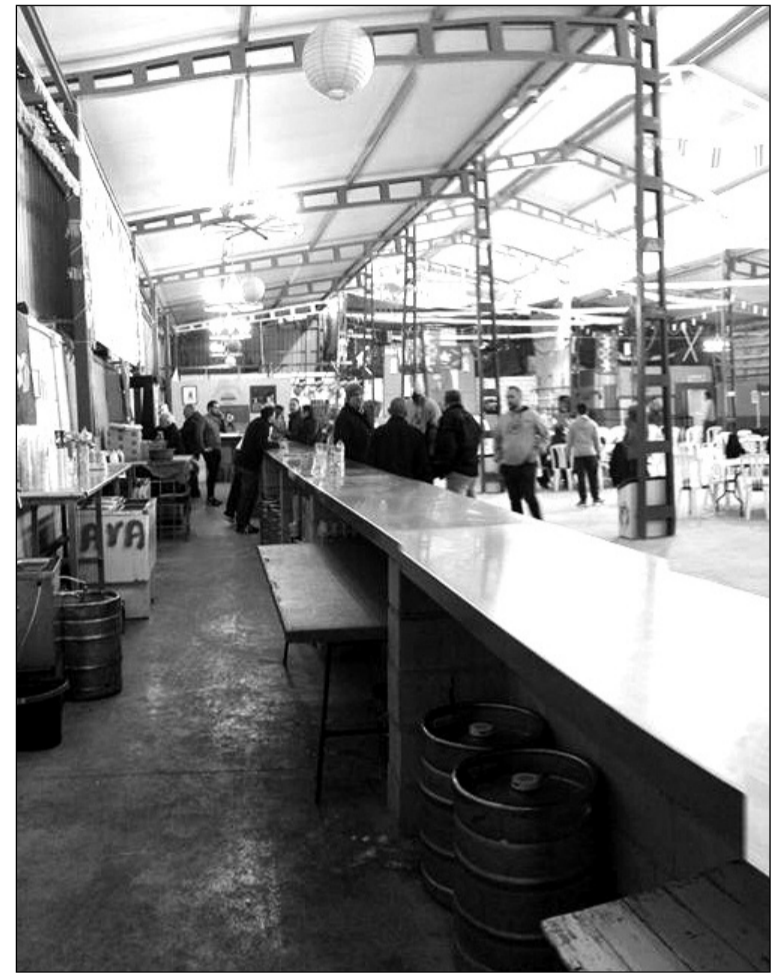
La actividad se desarrolló en la caseta de Los Prados.

pequeños, con la instalación de castillos hinchables también con el precio simbólico de un euro para colaborar con la causa.