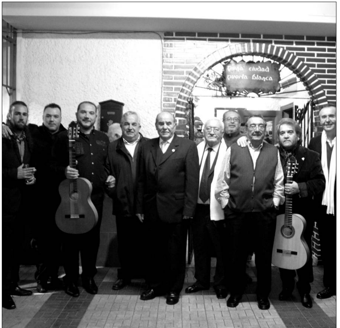
Foto de los participantes, organizadores e invitados en la semifinal del pasado fin de semana.

Será entonces cuando se definirán los premios de 2.400, 1.300, 800 y 400 euros para los cuatro primeros clasificados, que lograrán tener en sus vitrinas uno de los galardones más preciados del cante en la provincia de Málaga.