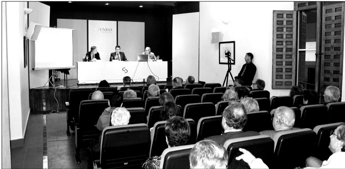
Vista general de la sala del Ateneo donde se desarrolló el acto.