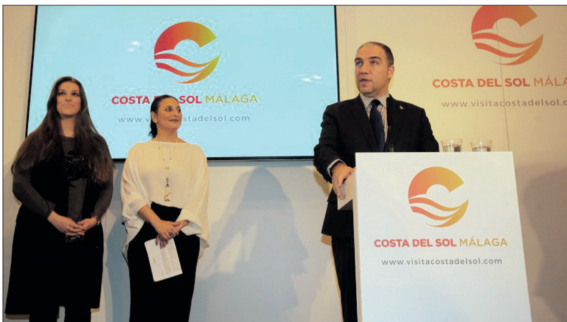
Bendodo presenta un avance de la programación junto a La Lupi, y Argentina,