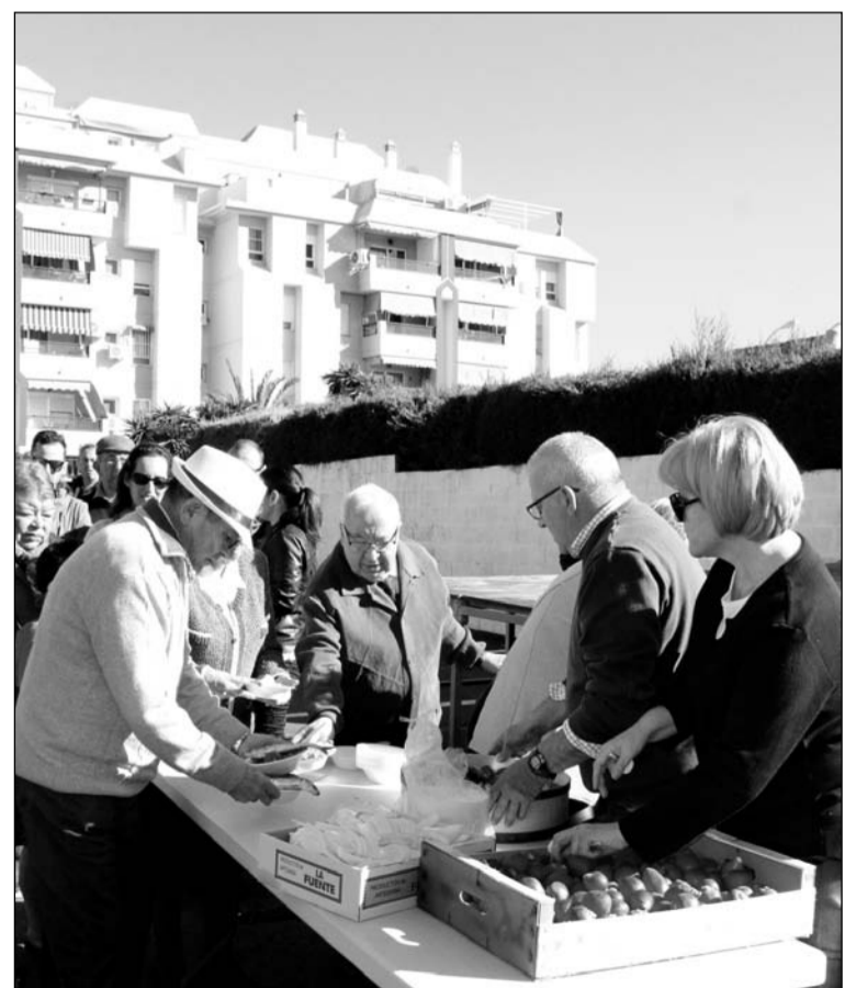
Reparto de las migas con arenques y rabanillos.