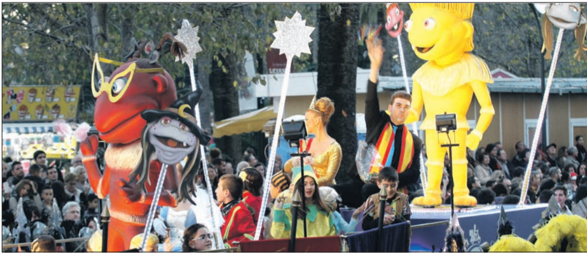
Lanzamiento de caramelos desde la carroza de la Federación.