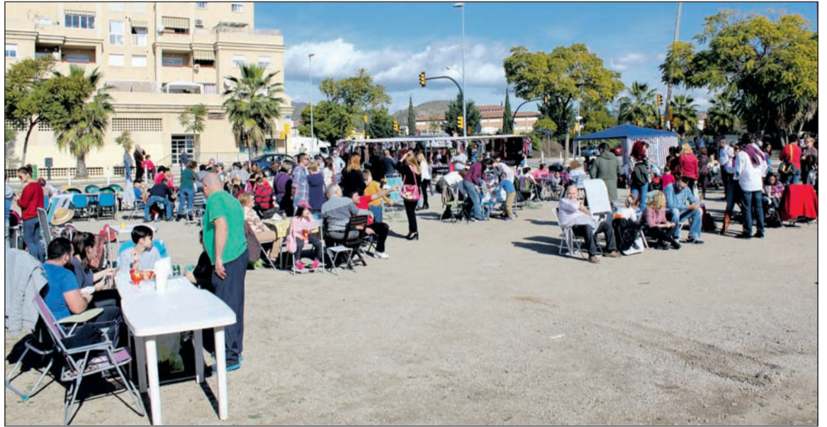
Numerosas personas se dieron cita el pasado año para disfrutar de una jornada de convivencia.

Además, numerosos vecinos, malagueños en general y componentes de otras peñas de nuestra capital se volverán a dar cita en esta actividad tan entrañable que suele estar acompañada por diversas actuaciones, y en la que se vive una agradable jornada casi campera, en pleno casco urbano.