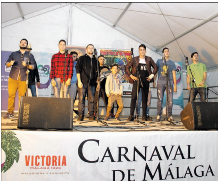
Una de las agrupaciones participantes en la edición del pasado año.

El reclamo de un buen potaje de berzas, preparado como cada año por los propios socios de la Peña Cortijo de Torre, y una gran sesión de coplas de carnaval es motivo más que suficiente para acudir a la Berza Carnavalesca y no faltar a esta gran cita con murgas y comparsas.