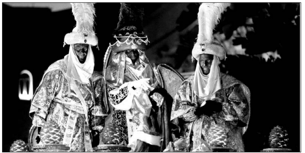
Séquito real del Rey Baltasar en su carroza.