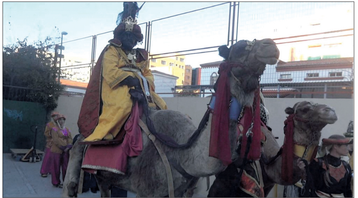
Los Reyes Magos recorrieron Cruz de Humilladero en camellos.

en discurrir las calles de Málaga este año 2017 fue la del Distrito Málaga Este, que tenía lugar el miércoles 4 de enero a las 17:30 horas desde la plaza Virgen Milagrosa.