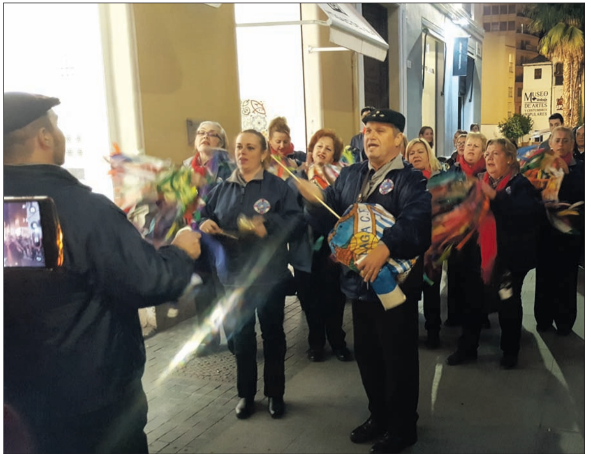
La pastoral de la Peña Er Salero, por el entorno de la plaza de Camas.

Con estos recorridos, se ha logrado que la mayoría de los espacios del Centro hayan contado estas navidades con las actuaciones de las pastorales. De hecho, en el encuentro del 18 de diciembre una de las principales novedades fue un recorrido que partía desde la plaza de la Aduana y recorría diferentes calles como Santa María, Cister, Molina Lario, plaza del Siglo y del Carbón, o Sánchez Pastor. Éste se unía al tradicional por la calle Larios.