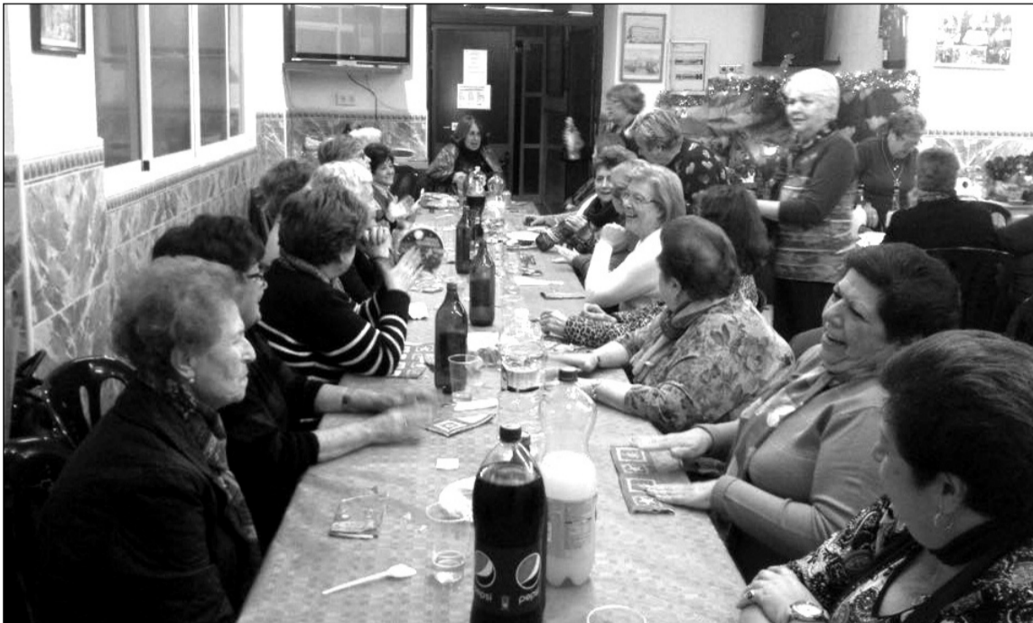
Encuentro de mujeres previo a la Navidad.