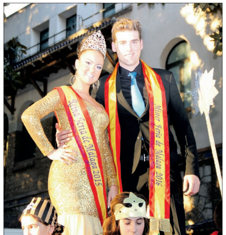
La reina y el mister, en la carroza.