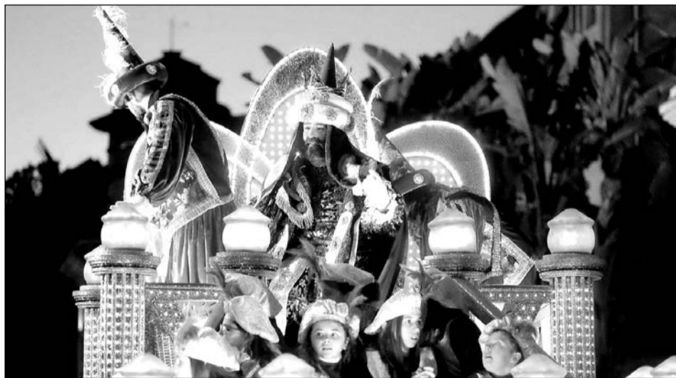
El Rey Gaspar lanza caramelos desde su trono.