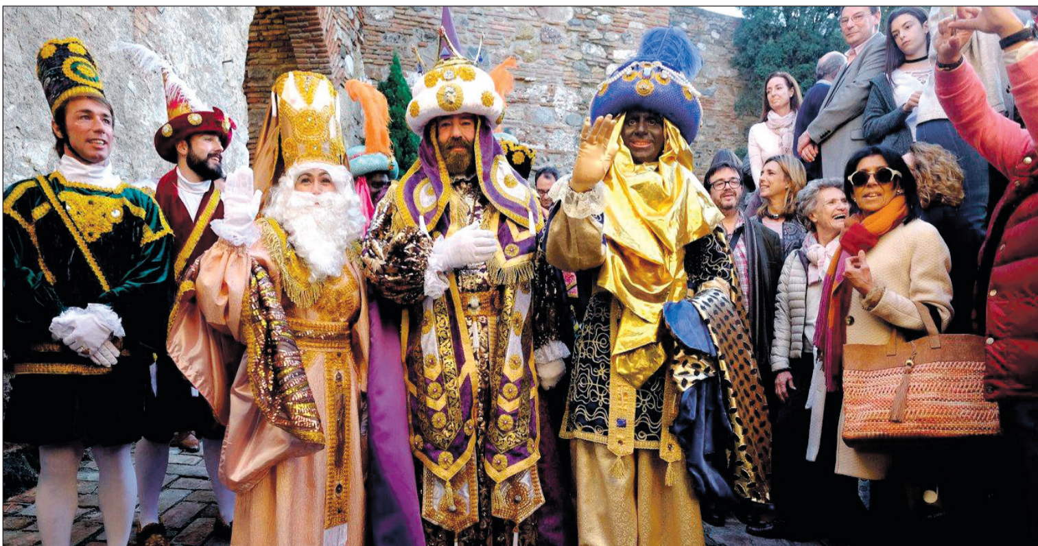
Melchor, Gaspar y Baltasar saludan a los malagueños que les aguardaban en la puerta de la Alcazaba.