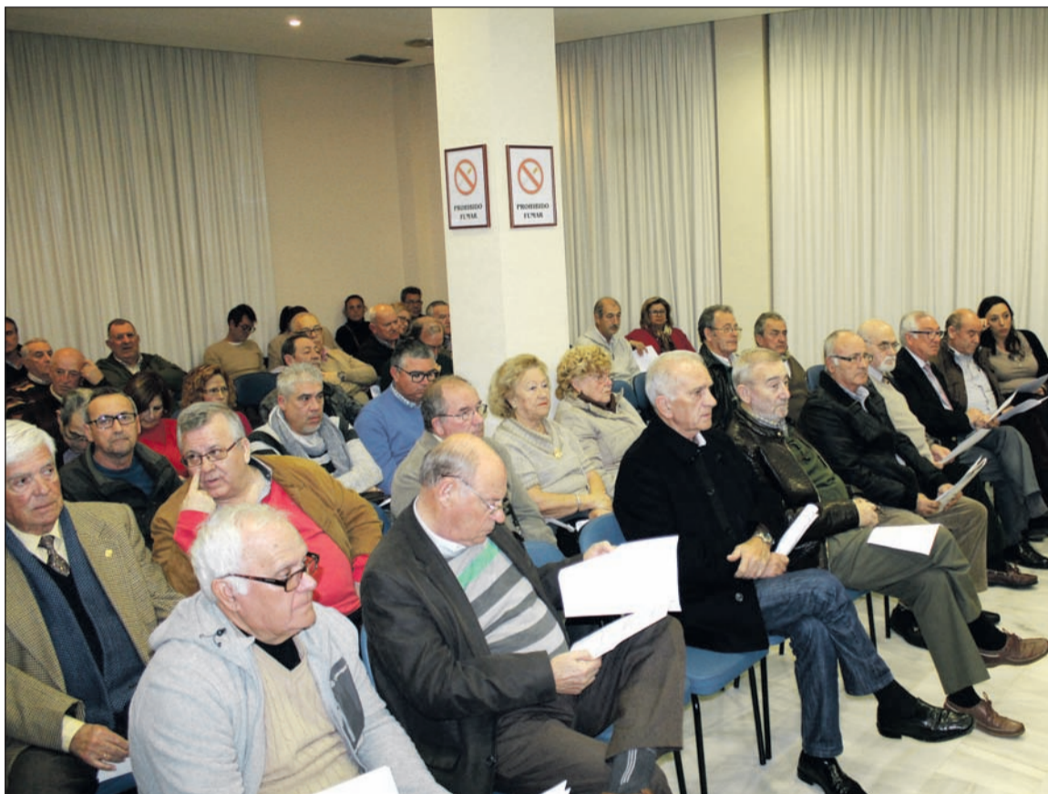
Asistentes a la asamblea del pasado año.

Además, es tradicional en este acto que se proceda al sorteo de banderas para el Día de Andalucía, el primer gran acto que organiza cada año la Federación Malagueña de Peñas y que, como es tradicional, se desarrollará en la mañana del 28 de febrero con la entrega de enseñas de Andalucía, Málaga y la provincia entre las entidades que componen este colectivo.