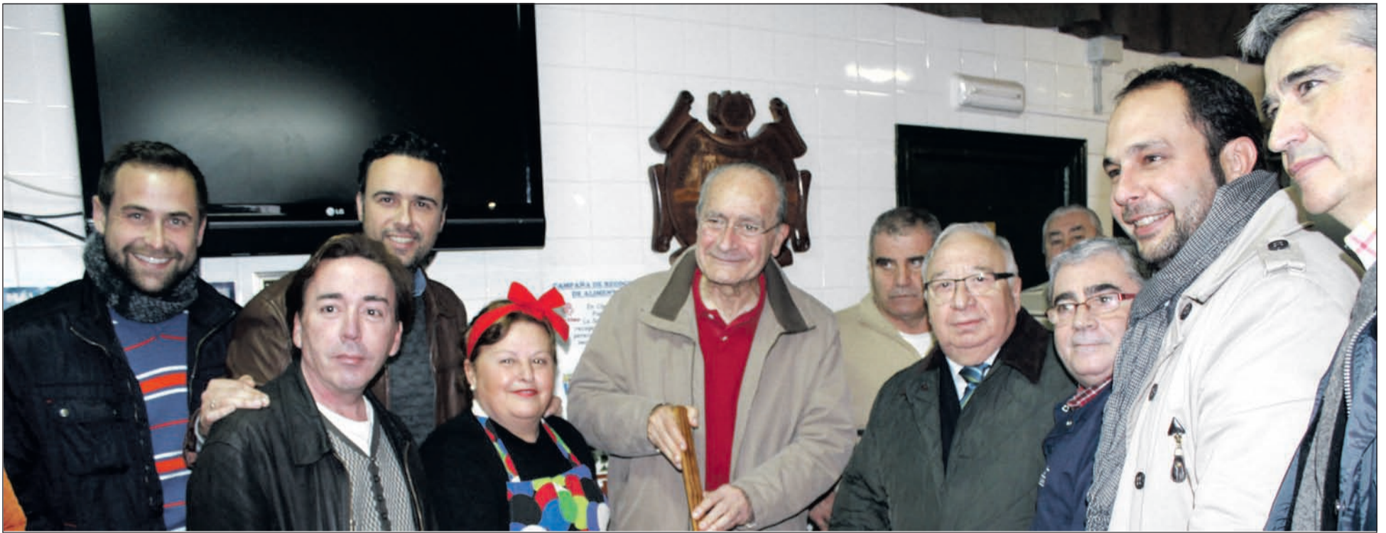
Preparativos de la Berza en una edición anterior.