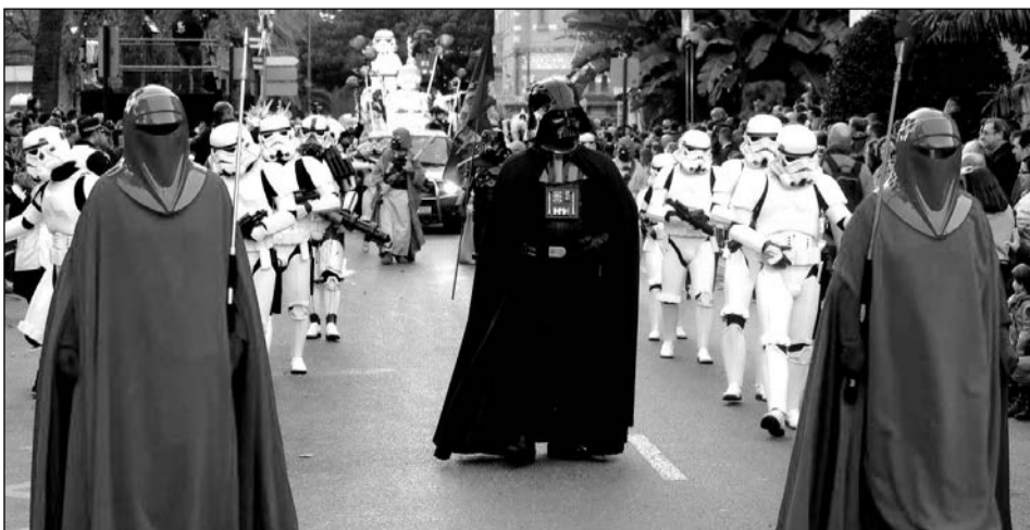
La Legión 501 de Star War fue otro de los alicientes.