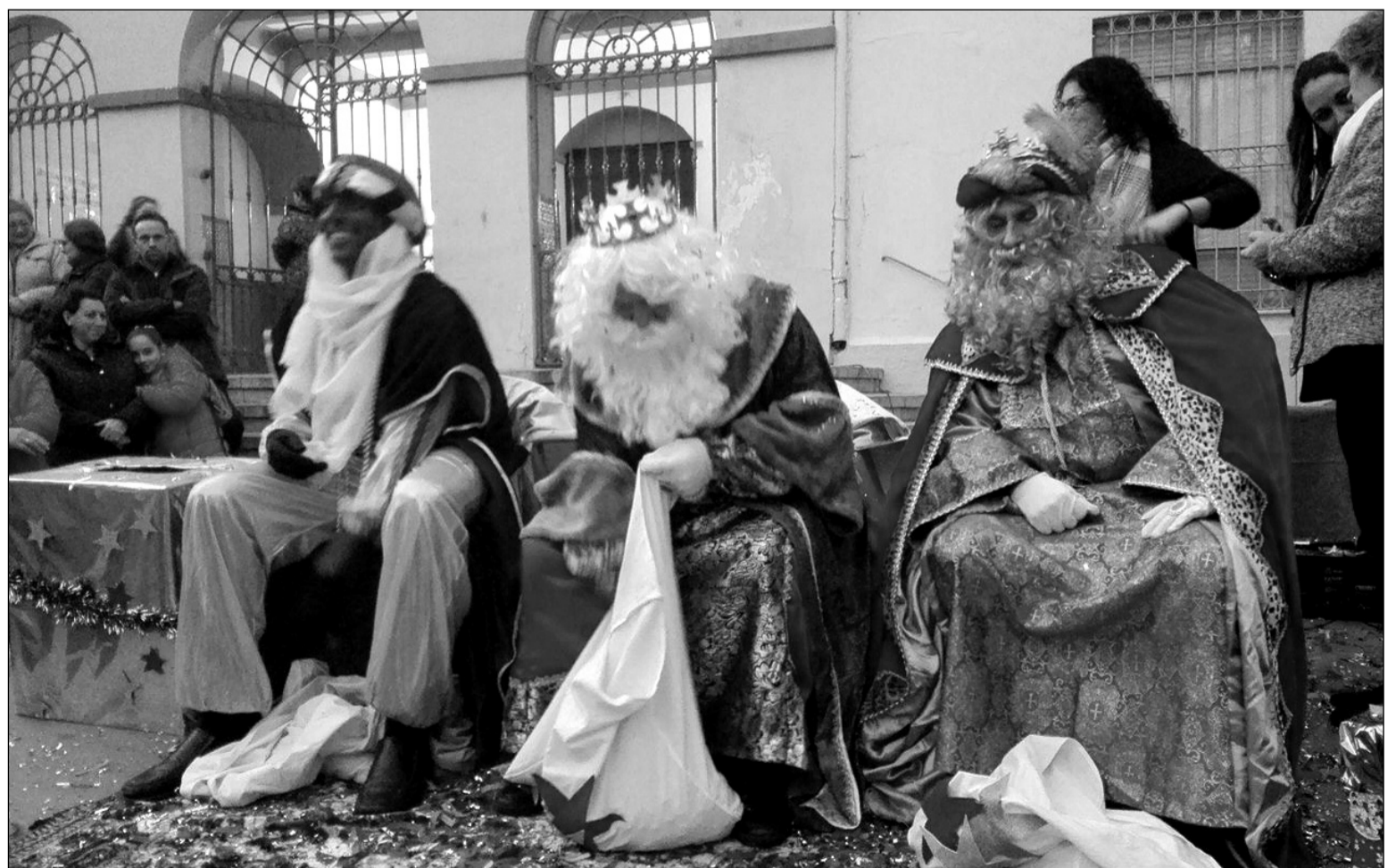
Recibimiento a los Reyes Magos en la plaza de Capuchinos.

Esta actividad, a diferencia de otras, no tenía lugar en la sede de esta entidad perteneciente a la Federación Malagueña de Peñas, Centros Culturales y Casas Regionales 'La Alcazaba', sino que se desarrollaba en uno de los espacios más emblemáticos de su barrio como es la plaza de Capuchinos, donde los menores pudieron compartir unos instantes con los Magos de Oriente.