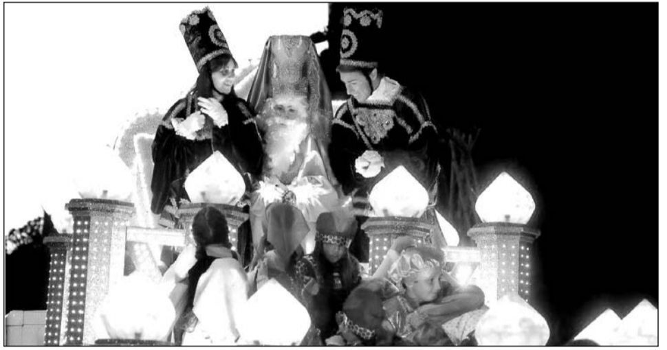
Carroza del primero de los Reyes Magos.