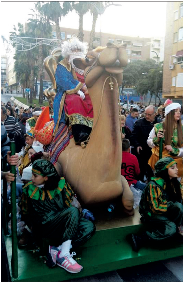
El Rey Melchor de la cabalgata de Bailén Miraflores.