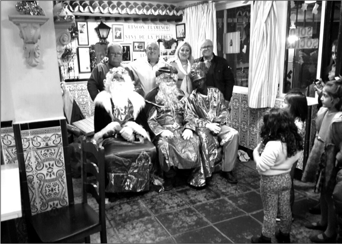
Niños atentos a los Reyes Magos en su visita a la sede de la entidad.