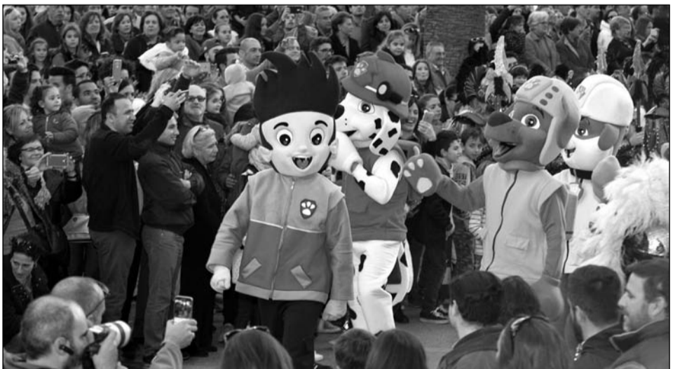
Los más pequeños disfrutaron con los personajes de la Patrulla Canina.