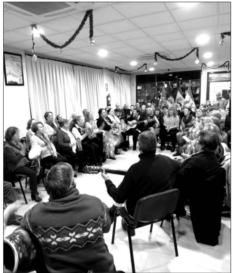
Se cantaron muchos villancicos en la sede de la Casa de Melilla.