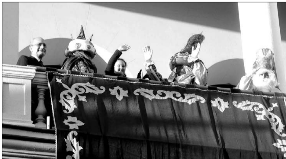
Saludo real desde el balcón del Consistorio.