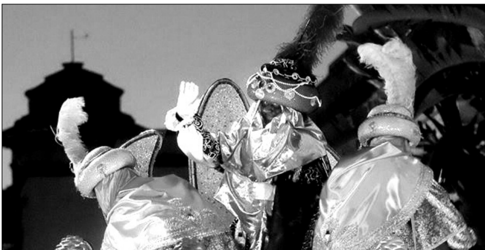
Baltasar saluda a los niños malagueños.