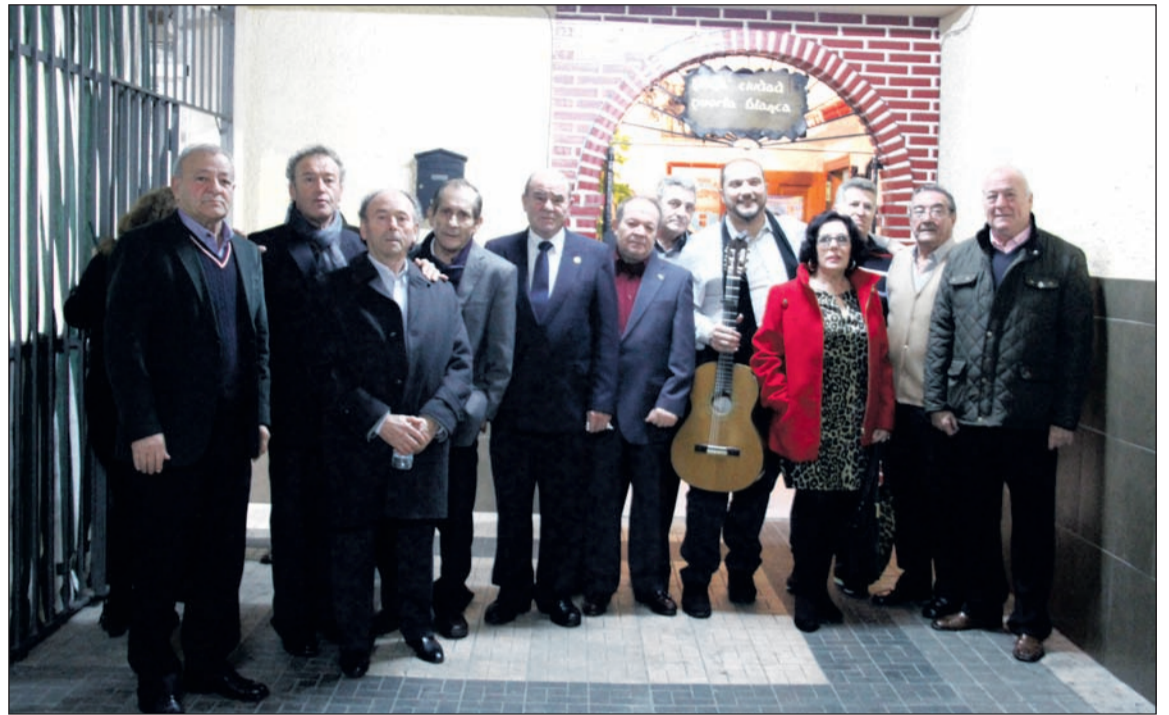
Artistas flamenco, componentes de la entidad e invitados en la puerta de la sede.