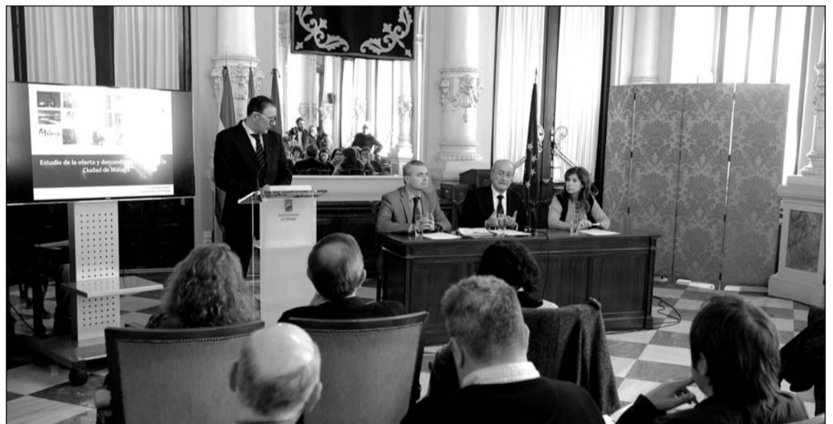
Un instante de la presentación del informe en el Salón de los Espejos del Ayuntamiento.

El estudio destaca que más de la mitad de los turistas que llegan a los museos de Málaga proceden de otros países (54,8 por ciento) mientras que el 44,5 por ciento son turistas procedentes de otras provincias españolas. Los turistas extranjeros