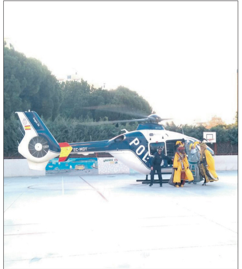
Los Reyes llegaron en helicóptero a Cruz de Humilladero.