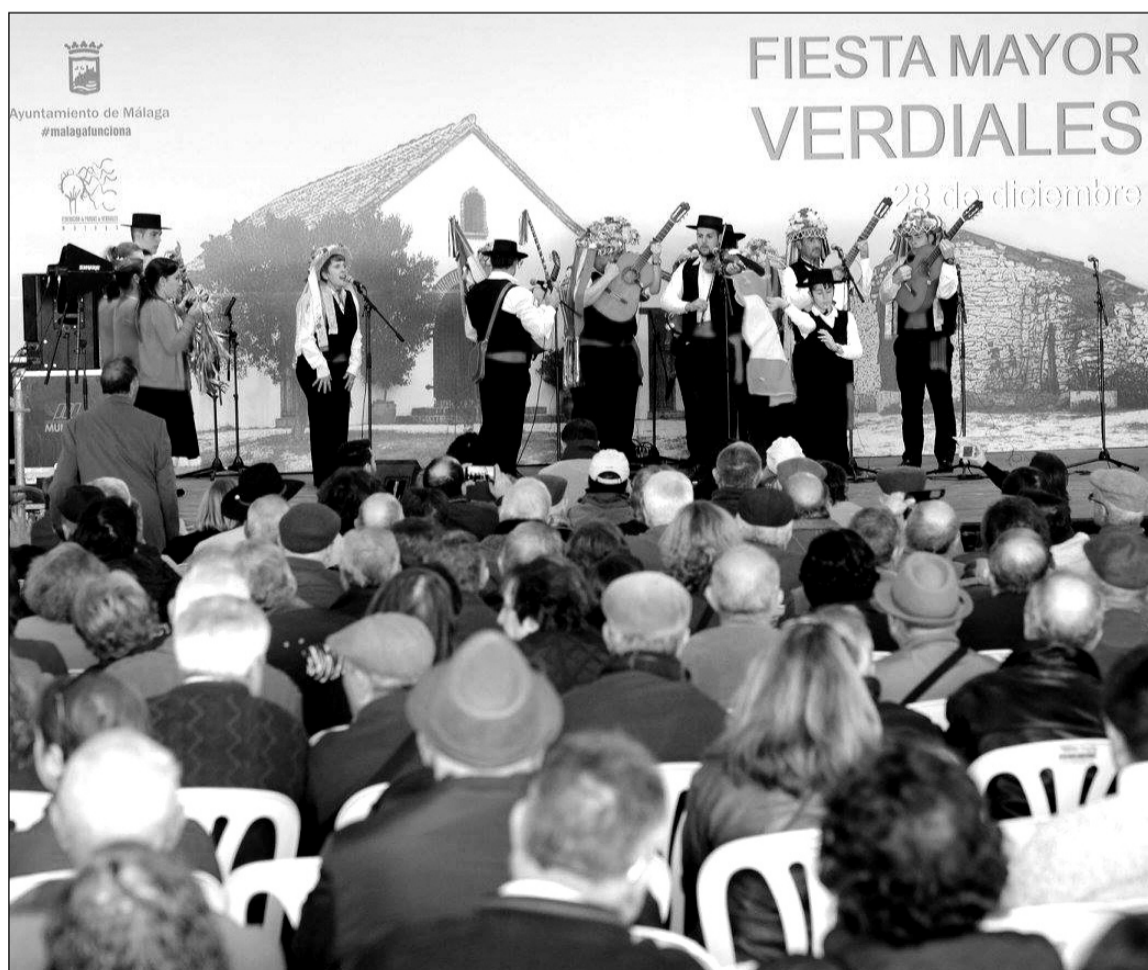
Una de las pandas actuando sobre el escenario de la carpa principal.