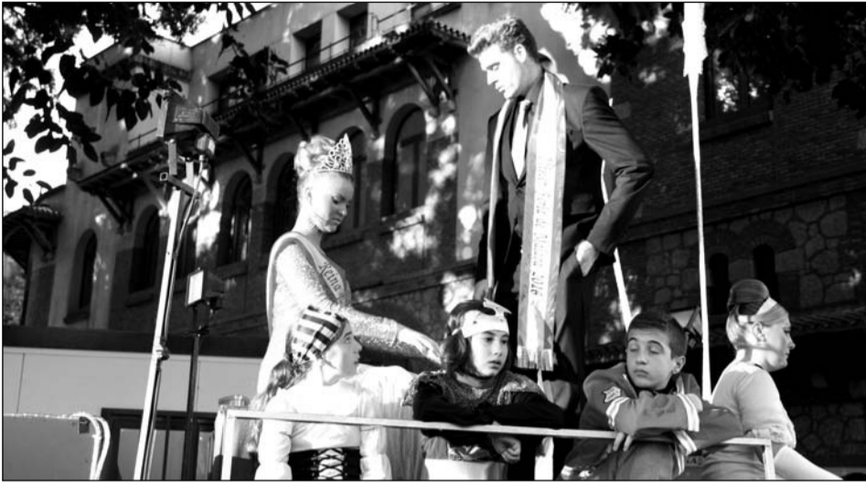
La Reina de 2015 y el Mister de 2016, en la carroza de la Federación.