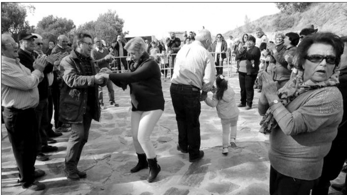
La romería se ha convertido en abanderada de la recuperación de las maragatas.