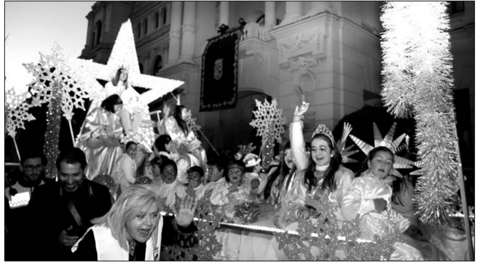
Llegada de la Estrella que anunciaba el Cortejo Real.