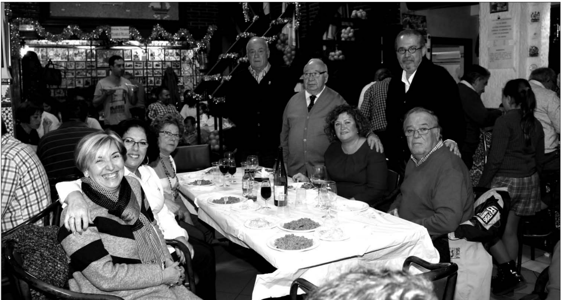
Una imagen de las Migas Flamencas de la pasada Nochebuena, con directivos de la Federación y socios de la Peña El Palustre.