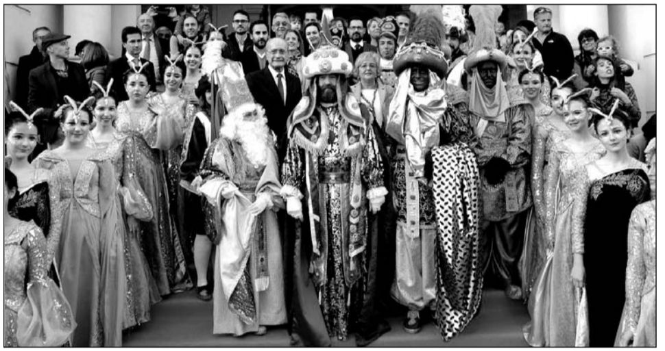
Los Reyes Magos, en la escalinata del Ayuntamiento.