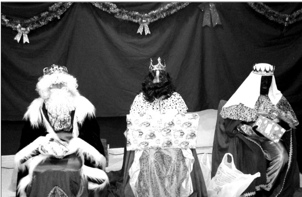
Los Reyes Magos, en su visita a la entidad.

Otra de las señas de identidad que en los últimos años tiene esta Peña Santa Cristina es la de ofrecer, tras las doce campanadas y tomar las uvas, un espectáculo pirotécnico de fuegos artificiales desde la terraza de su sede.