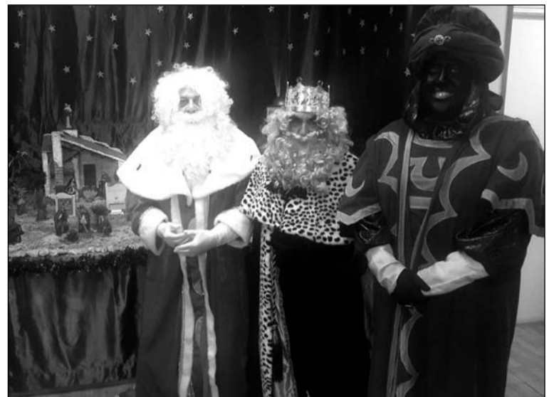
Sus Majestades, ante el Belén.