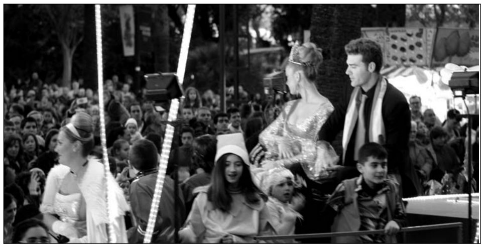
La carroza de la Federación de Peñas avanza entre el gentío.