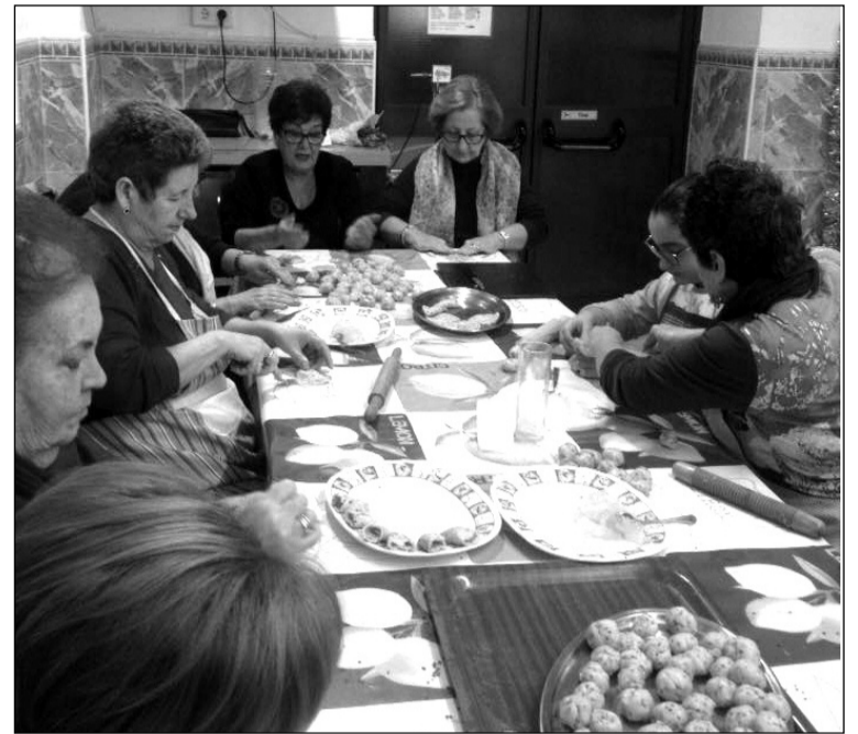
Grupo de socias preparando borrachuelos.

Las fiestas por excelencia del municipio que preside Óscar Mena, declarada de Interés Turístico Nacional de Andalucía y celebrada tradicionalmente el domingo antes de Navidad, contó con la presencia del presidente de la Diputación Provincial, Elías Bendodo, así como