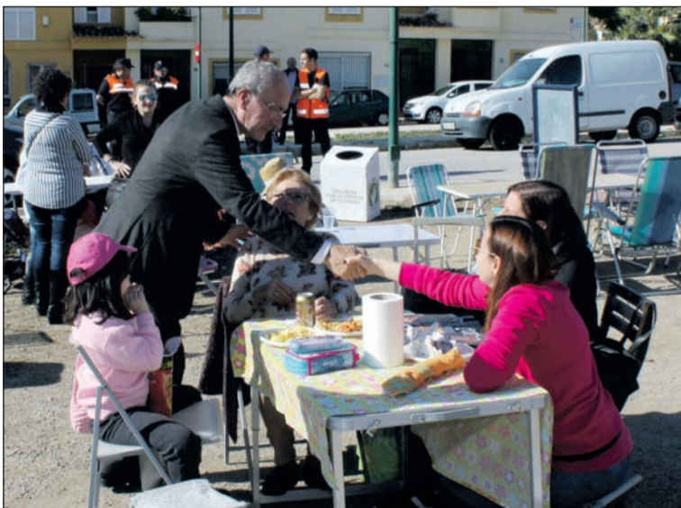
El alcalde saluda a unos de los participantes en las Migas del pasado año.