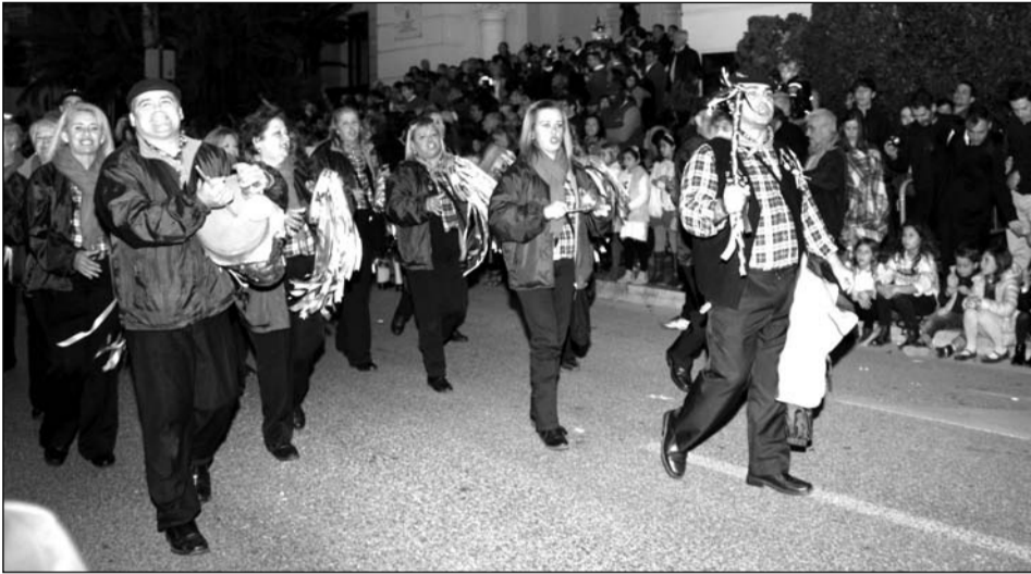
Pastoral de la Peña Er Salero durante la cabalgata.