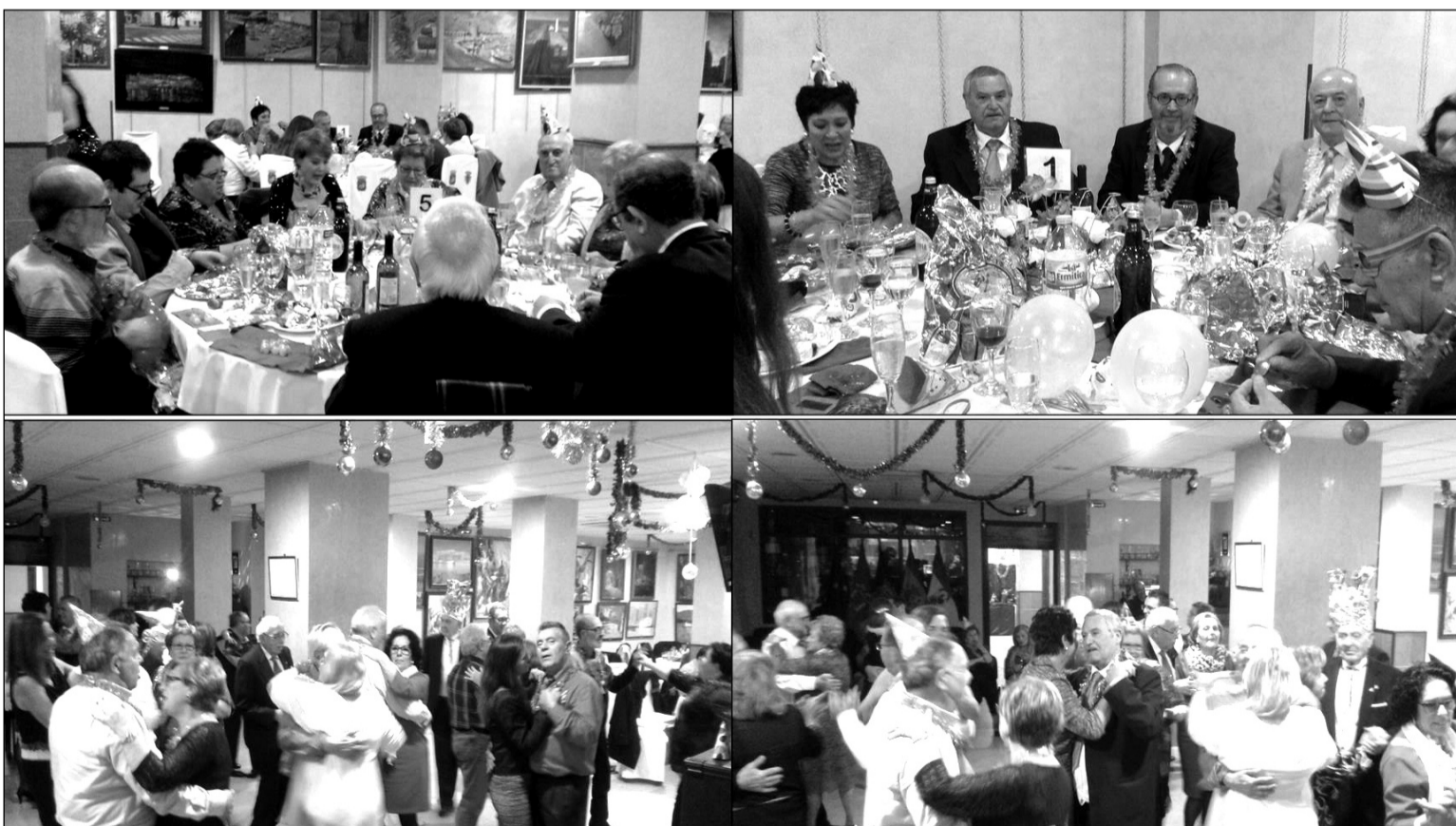
Distintos instantes de la celebración de la Nochevieja en la sede de la Casa de Melilla en Málaga.

Muy entrada la madrugada se sirvió el caldito para reponer fuerzas y los esforzados a bailar las festivas sevillanas y otros bailes autóctonos, concluían con karaoke final y con la copa larga hasta muy altas horas. Fueron instantes de alegría en compañía y largas despedidas, con los comentarios de haber pasado una feliz velada.