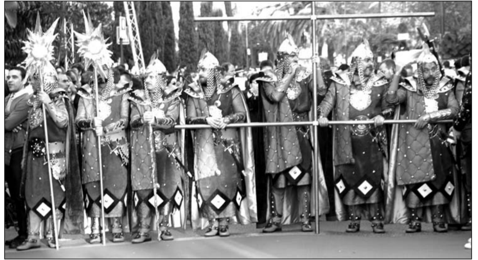
Guardia de Sus Majestades los Reyes Magos.