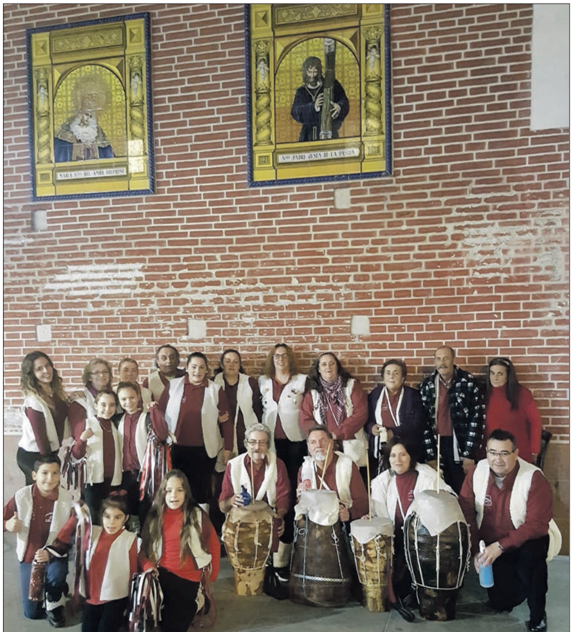
La pastoral de la Peña Los Pastores de Colmenarejo, ante la fachada de la iglesia de los Mártires.