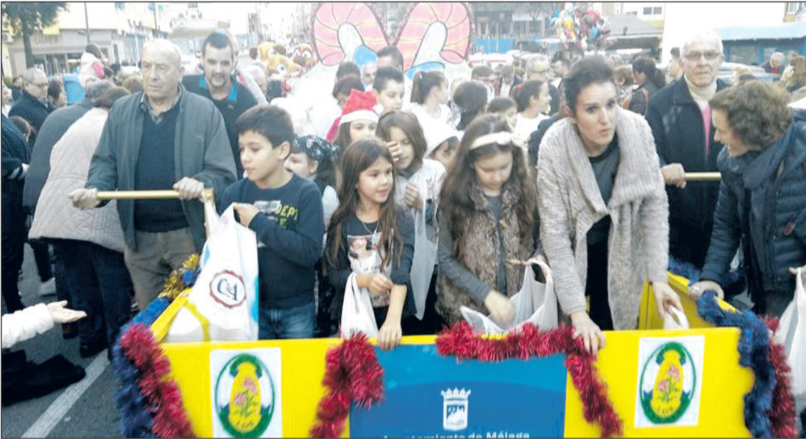
Pequeños de la Peña Los Rosales en el desfile de su distrito.