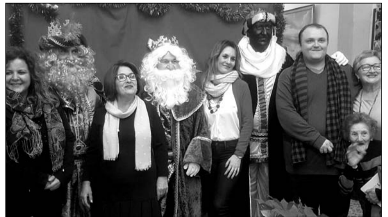
Los Reyes Magos con componentes de la entidad.