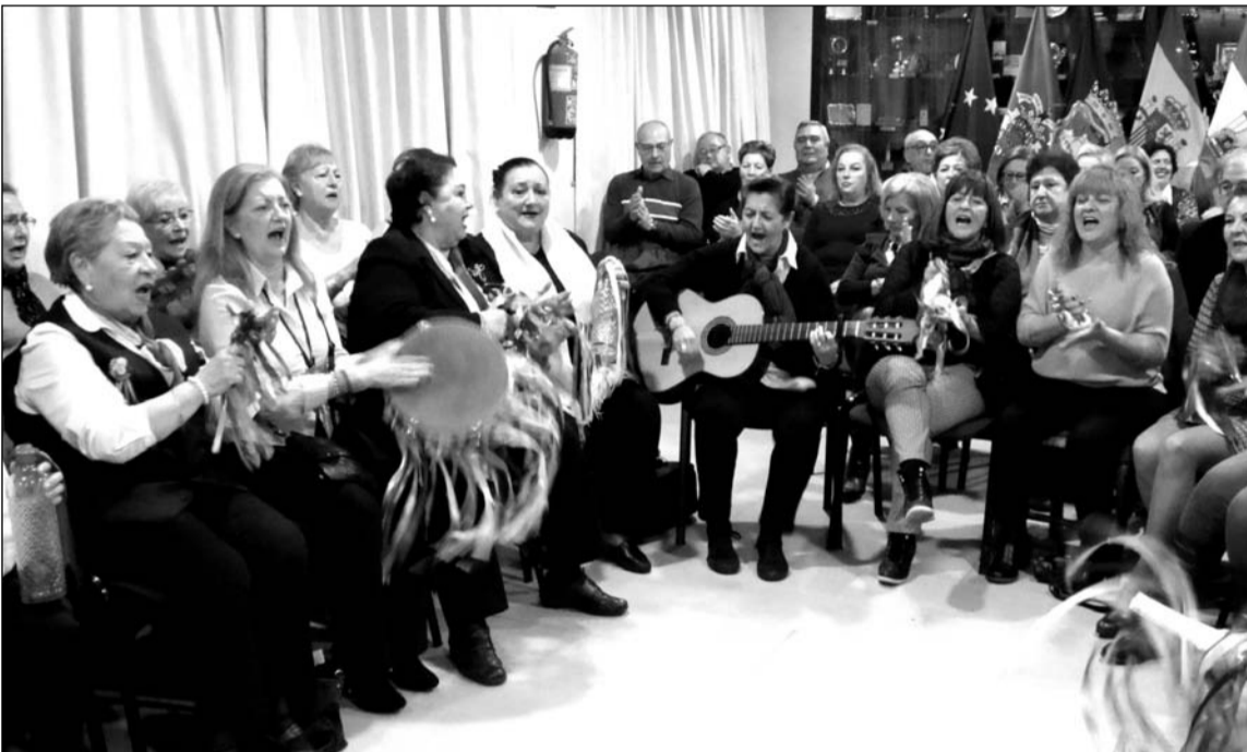
Un instante de la reunión de coros.