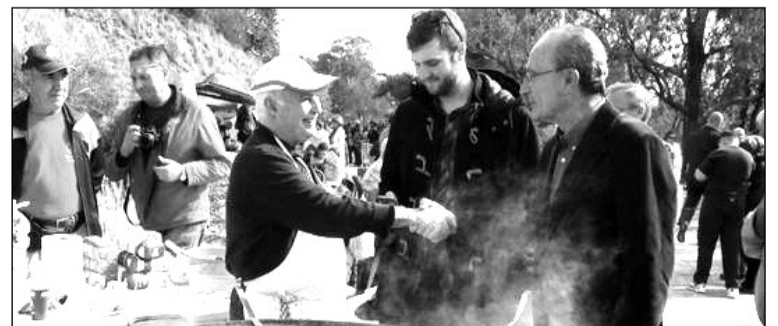
El alcalde saluda a un vecino que prepara una paella en la edición de 2016.

Esta Romería, que este año se celebra el 22 de enero desde las 11 horas, es diferente a todas, con actividades que son únicas, y donde el buen humor y la alegría inunda a todo el mundo. Todo ello en un lugar con unas vistas maravillosas que facilitan el disfrutar de una jornada campestre entre familiares y amigos.