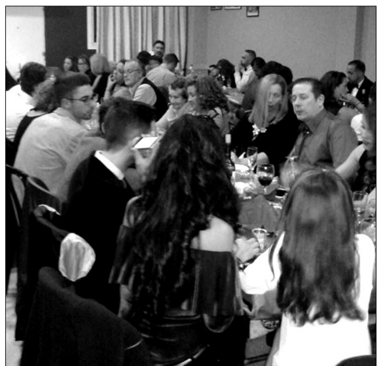
Aspecto que presentaba el salón en Nochevieja.