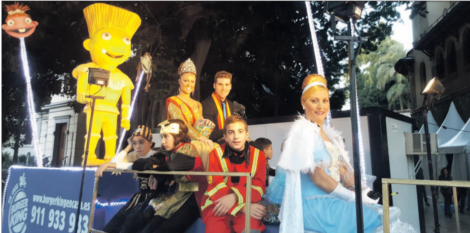
Carroza de la Federación Malagueña de Peñas, que un año más estuvo presente en la cabalgata de la ciudad.

Número 616 11 de Enero de 2017 C/ Pedro Molina, 1 Tfno: 952 22 54 39 Fax: 952 21 48 82 E-mail: prensa@femape.com - la_alcazaba@hotmail.com Web: www.femape.com Edición digital: www.femape.com/laalcazabadigital Twitter: @FMPLaAlcazaba Facebook: www.facebook.com/FMPLaAlcazaba