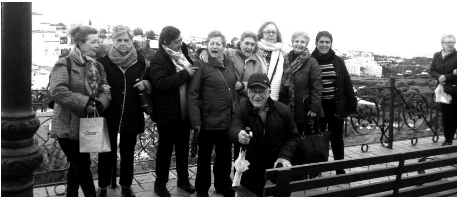
Componentes de la Peña Nueva Málaga en un mirador de Torrox durante la Fiesta de las Migas de la localidad.

Aún habría tiempo para reunirse una vez más, en esta ocasión para preparar los tradicionales borrachuelos que han podido ser degustados por los socios durante estas últimas semanas.