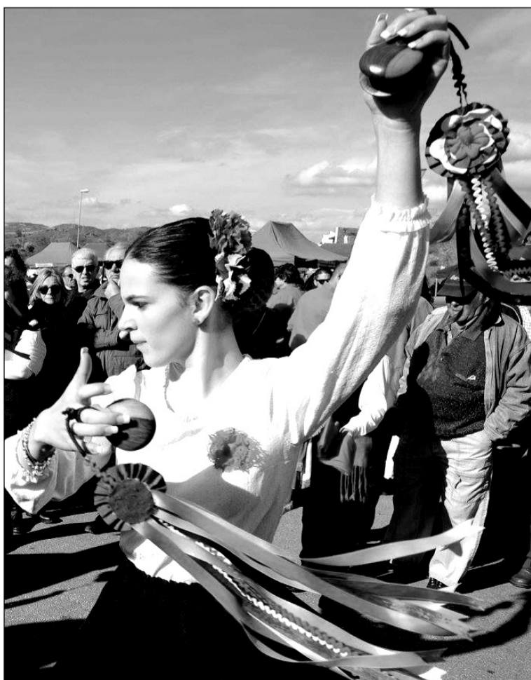
Baile de verdiales en el Puerto de la Torre.