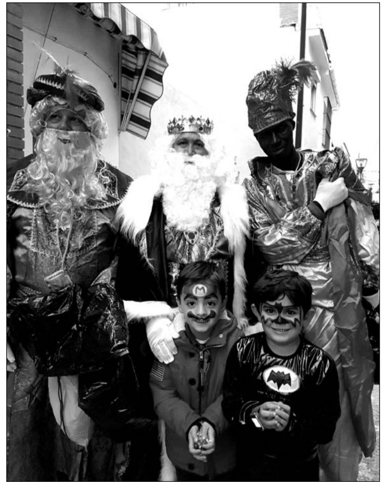
Sus Majestades, con dos pequeños que participaron de esta actividad.

En esta ocasión, Melchor, Gaspar y Baltasar llegaron andando por el Paseo Marítimo, repartiendo todo tipo de juguetes, caramelos, globos y rega-