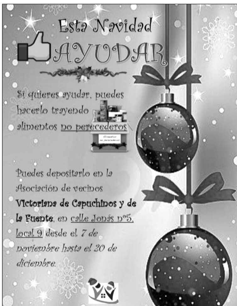
Cartel de la campaña de recogida de alimentos.

Junto a este componente solidario, la Navidad también va a seguir los cauces tradicionales en la sede de esta entidad federada, procediéndose a la inauguración del Belén en el transcurso de un acto celebrado en la tarde del pasado sábado 10 de diciembre.