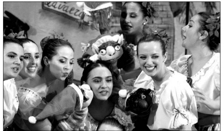
Un instante del espectáculo.