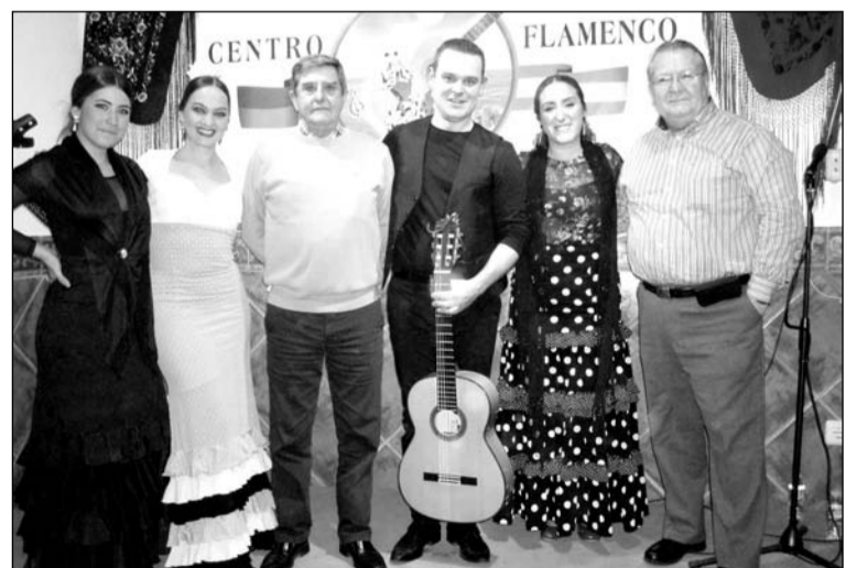
Artistas flamencos con componentes de la entidad.