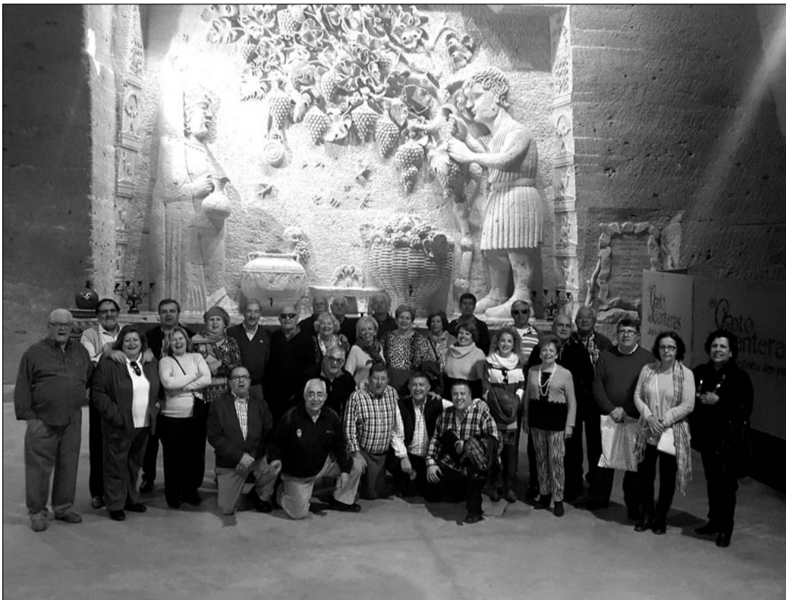
Imagen de grupo durante la visita.