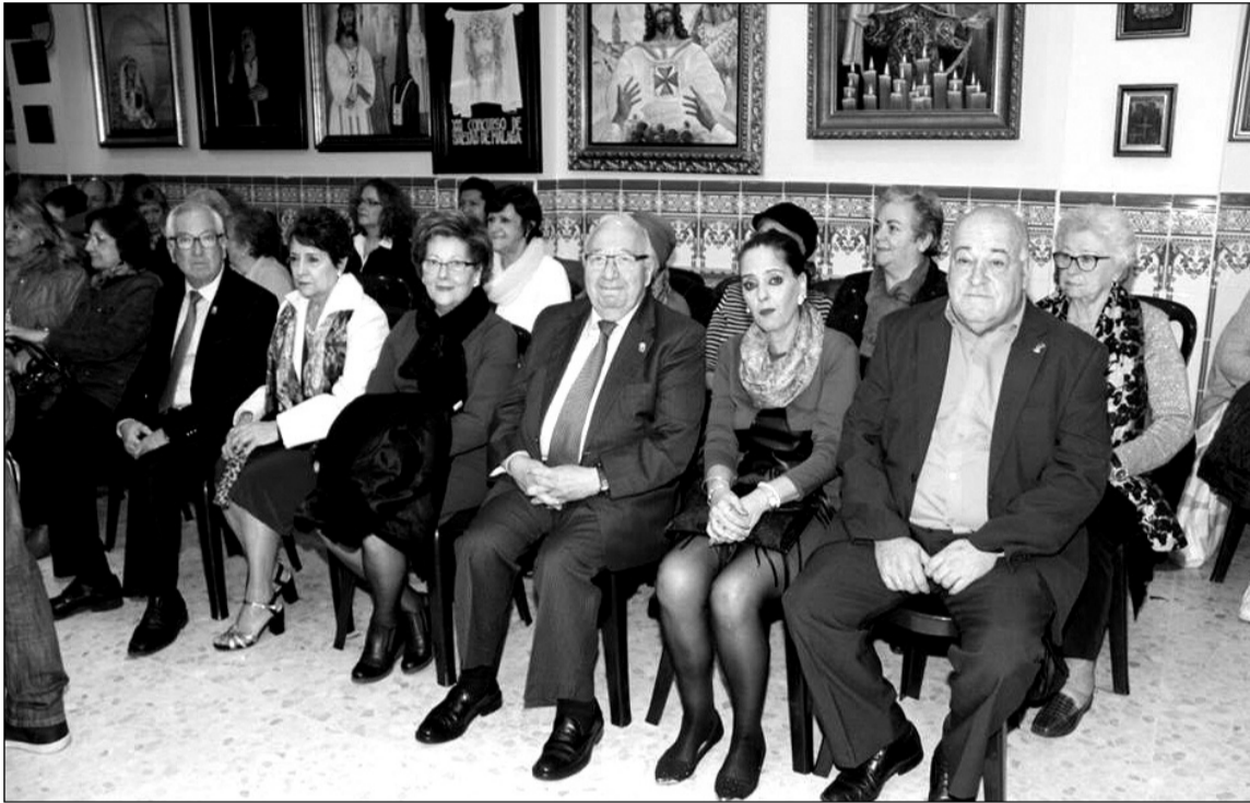
Disfrutando del acto la representación de la Federación, atendida por el presidente y su esposa.