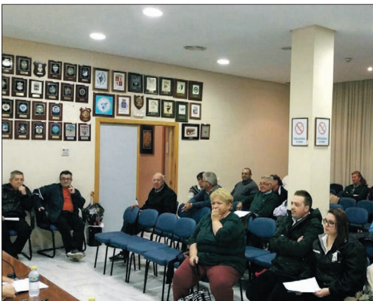
Reunión con representantes de las pastorales en la sede de la Federación.