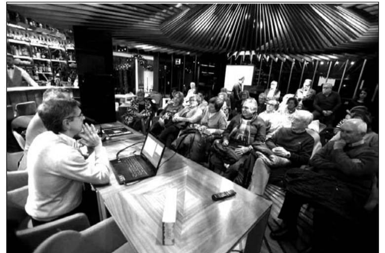
Tertulia celebrada en La Sole de El Pimpi.