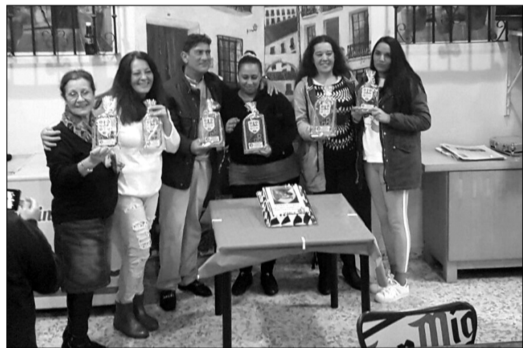
Entrega de premios del torneo de parchís.

La programación navideña concluye el viernes 6 con el 'Arroz de Reyes'.