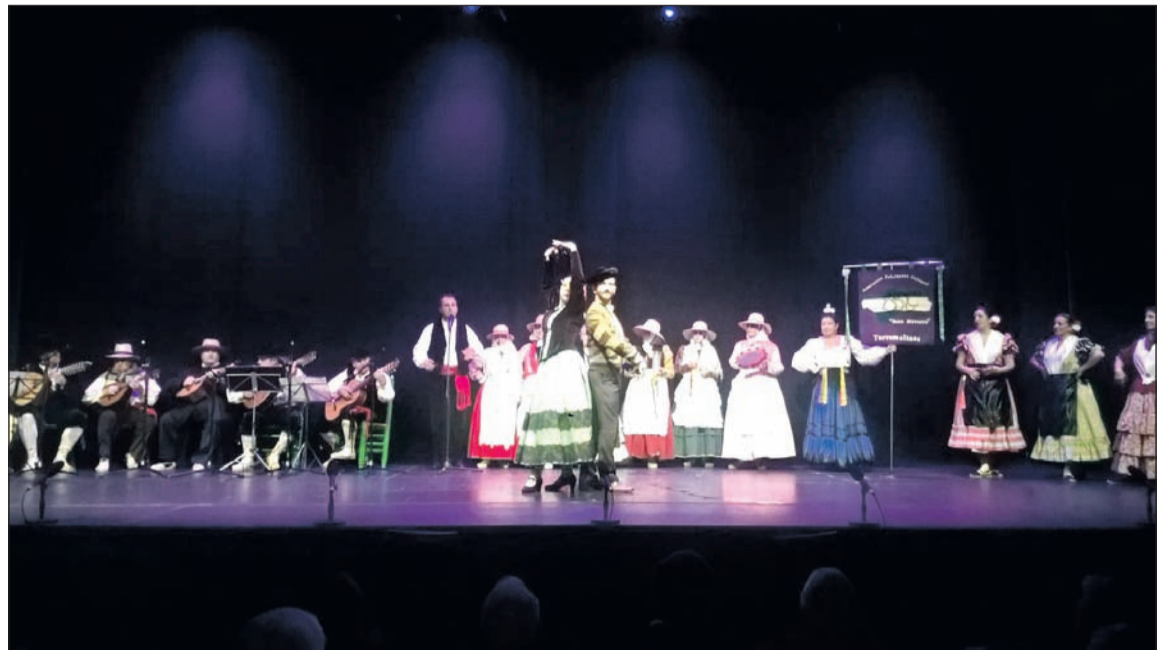
Actuación de la Asociación Folclórica Juan Navarro de Torremolinos.