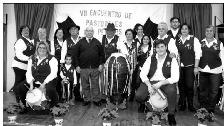
El presidente de la Federación con la Pastoral de la Peña Finca La Palma.