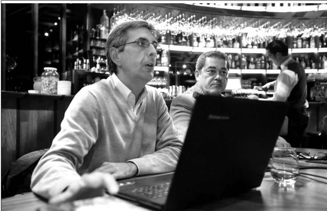
Un instante de la conferencia.

Al final se servirá una copa de vino tinto Andresito, de bodegas Niño de La Salina de Almargen, con un pan de fermentación lenta de La Mallorquina para mojar en aceite de oliva virgen extra premium hojiblanca de la almazara 100 Caños; productos que son seleccionados y facilitados por la Alacena de Málaga.