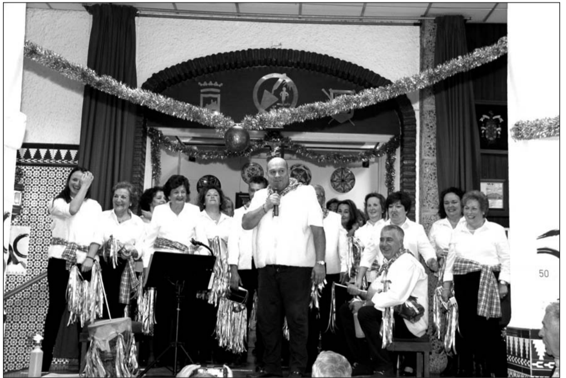
Actuación de la pastoral de la Peña El Palustre.