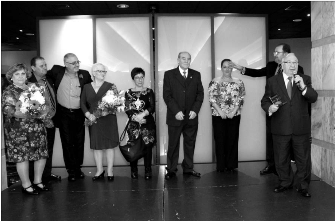
Intervención del presidente de la Federación Malagueña de Peñas durante el XL Aniversario.