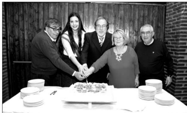
Componentes de la entidad cortan la tarta conmemorativa.