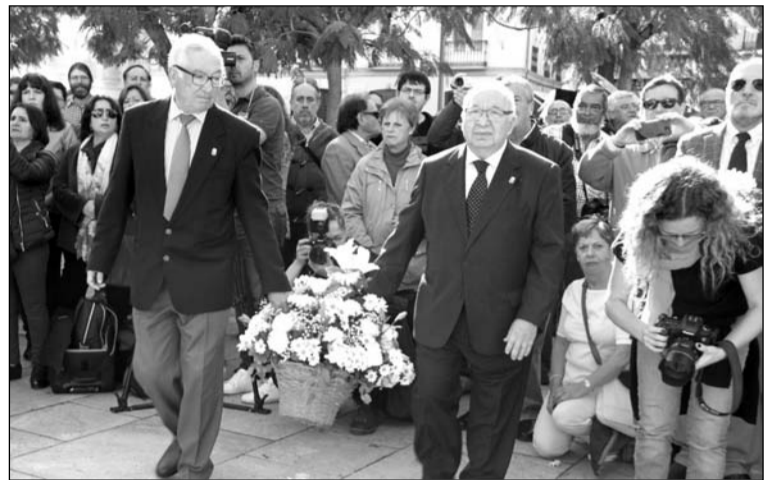
Ofrenda floral de la Federación Malagueña de Peñas a Torrijos.

Un año más, la Federación Malagueña de Peñas quiso unirse a la Asociación Histórico Cultural Torrijos en el recuerdo que con su recreación histórica realizan al hombre cuyo pronunciamiento iba a derrocar a Fernando VII y que fue apresado y fusilado en Málaga el 11 de diciembre de 1831. El colectivo peñista, al igual que lo hizo la corporación municipal de nuestra capital, hizo una ofrenda floral en el acto celebrado en la plaza de la Merced.