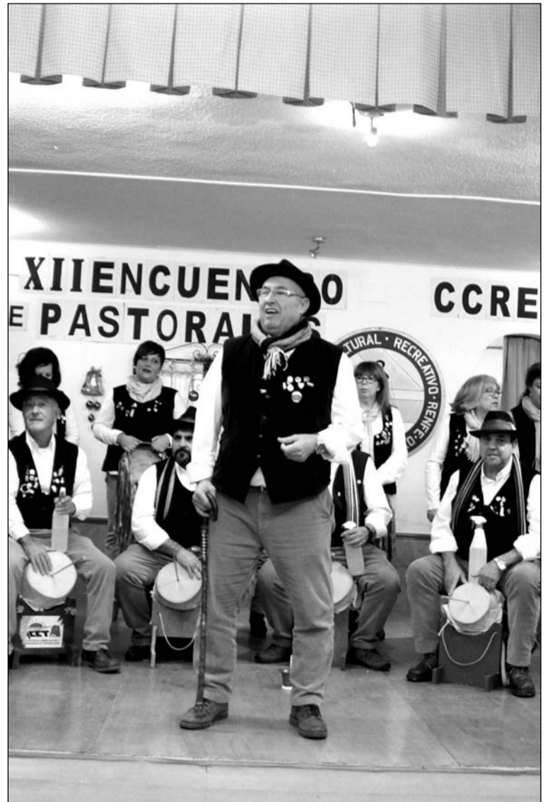
Detalle de la actuación de la pastoral de la entidad organizadora.

Además, se contó con visitas muy destacadas, como la del alcalde de Málaga Francisco de la Torre, la teniente de alcalde Teresa Porras o el presidente de la Federación Malagueña de Peñas, Centros Culturales y Casas Regionales 'La Alcazaba'.