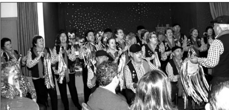
Intervención de una pastoral durante la inauguración del Belén.

diciembre se procedía al acto de inauguración oficial del Belén que como cada año ha instalado en su sede esta entidad federada.