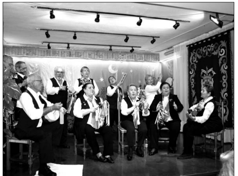
Actuación del coro de la Casa de Melilla ante el belén.