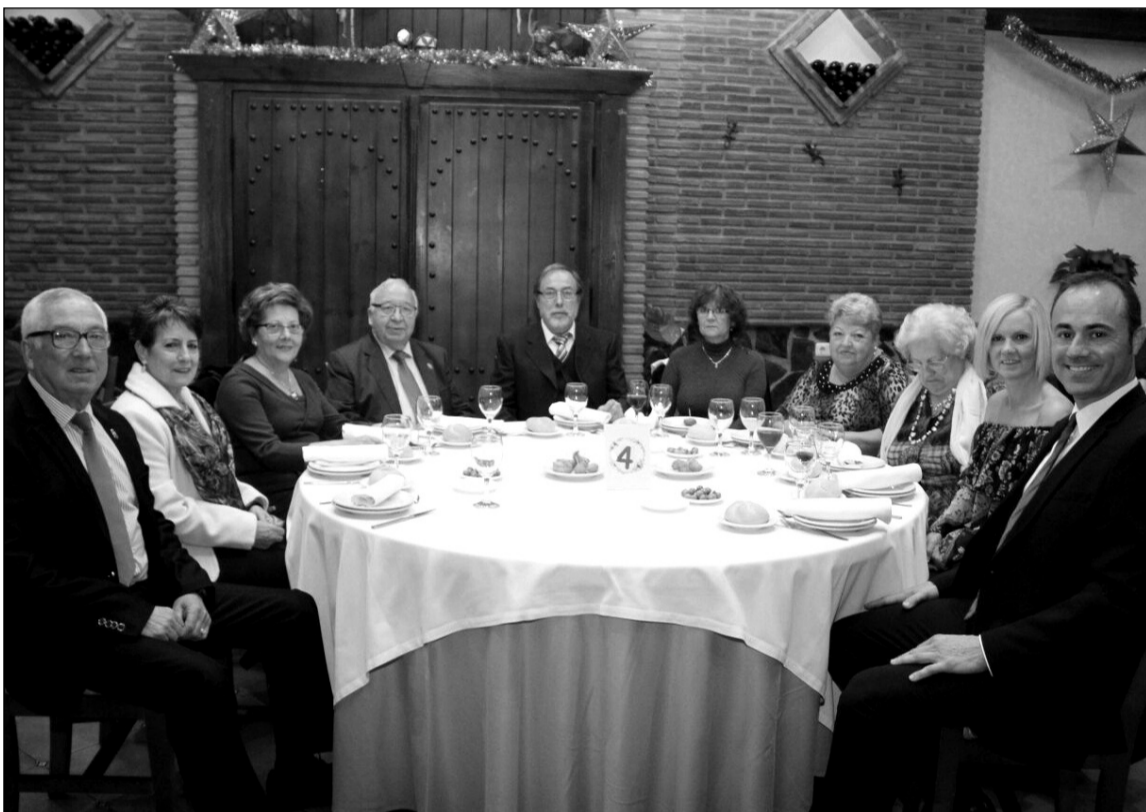
Mesa presidencial durante la celebración del aniversario de la Peña Perchelera.

Desde esta entidad federada se hizo entrega de recuerdos y trofeos a diferentes componentes, en un acto que se cerraba con música en directo que animó a bailar a los presentes.