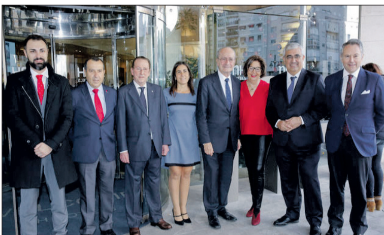
Autoridades e invitados al acto.