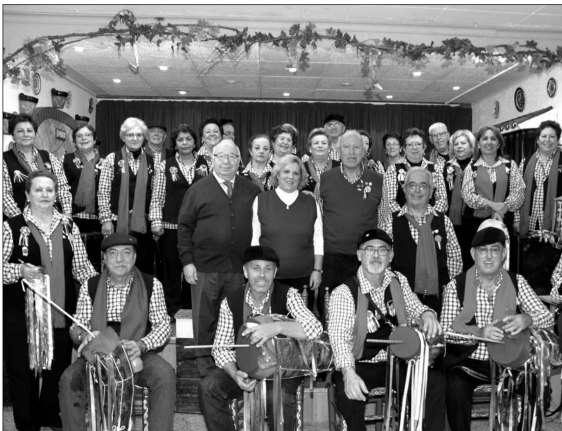
Un instante del Encuentro de Pastorales de la Peña El Parral.