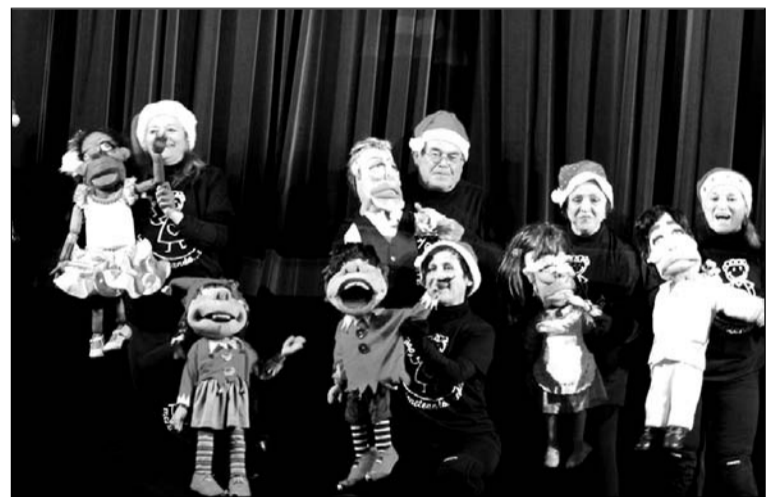
Grupo de marionetas llegado desde Jaén.