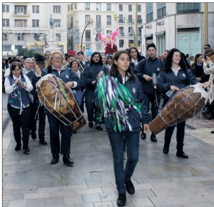
Imagen de archivo de la pastoral de la Peña Finca La Palma el pasado año.

La Federación Malagueña de Peñas, Centros Culturales y Casas Regionales 'La Alcazaba', con el patrocinio del Ayuntamiento de Málaga, organiza el XIX Encuentro de Pastorales 'Memorial José María Martín Carpena'.