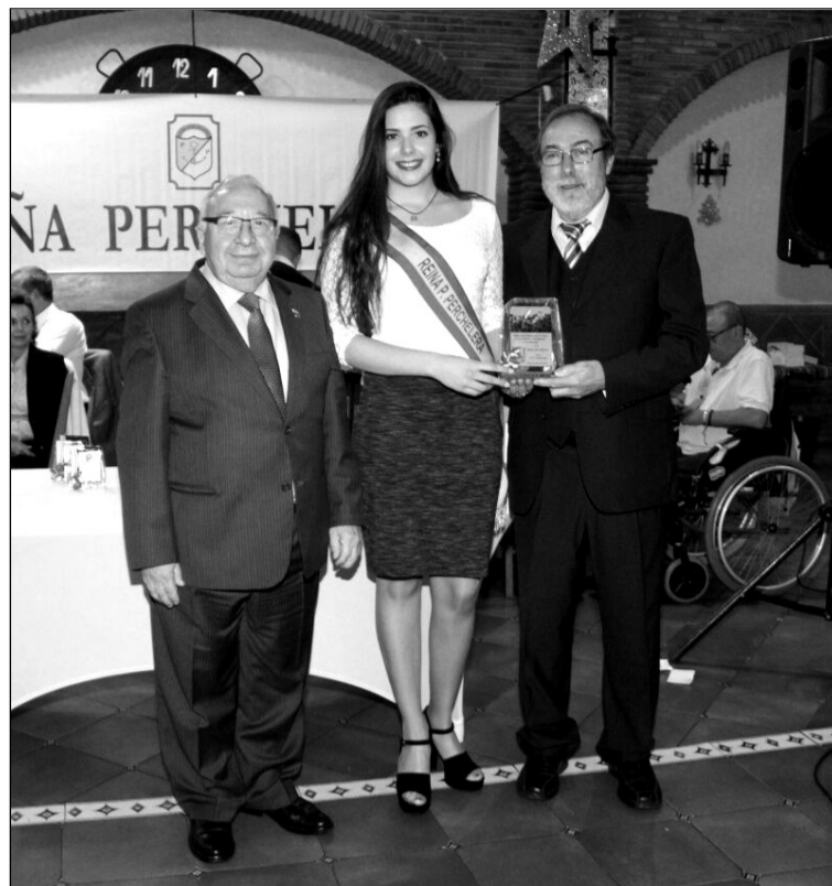
La entidad quiso invitar a su Reina de la Feria.