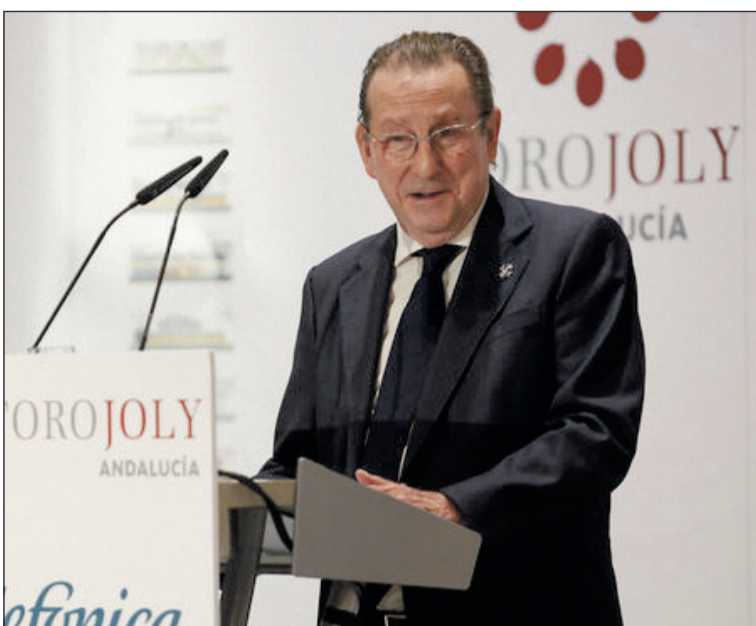
El consejero de Justicia, durante su intervención.