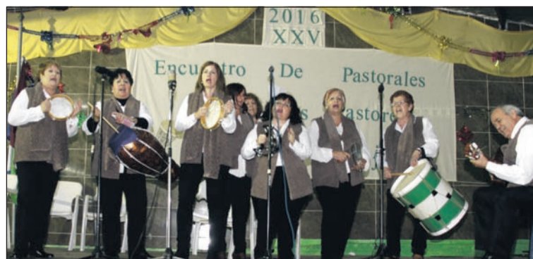
Una de las actuaciones.