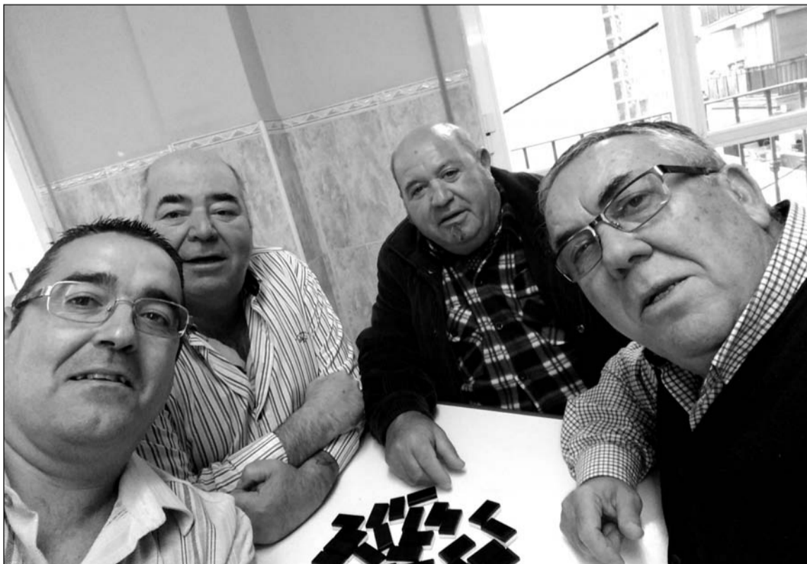
Participantes durante la disputa del torneo.

El pasado martes 6 de diciembre tenía lugar su inauguración oficial con un acto que congregaba a sus socios y simpatizantes, y que servía para dar por inaugurados los actos que con motivo de la navidad se van a vivir en la sede ubicada en la calle Princesa de nuestra capital.