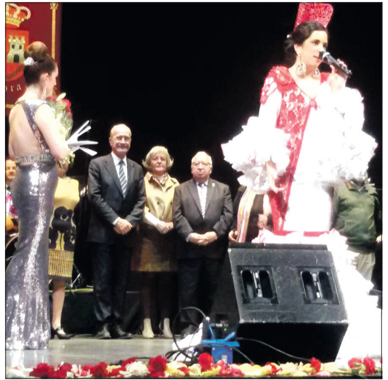
La ganadora agradece su premio en presencia de las autoridades.