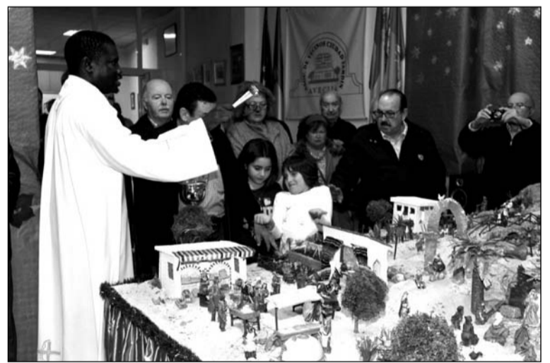
Instante en que se procede a la bendición del Belén.