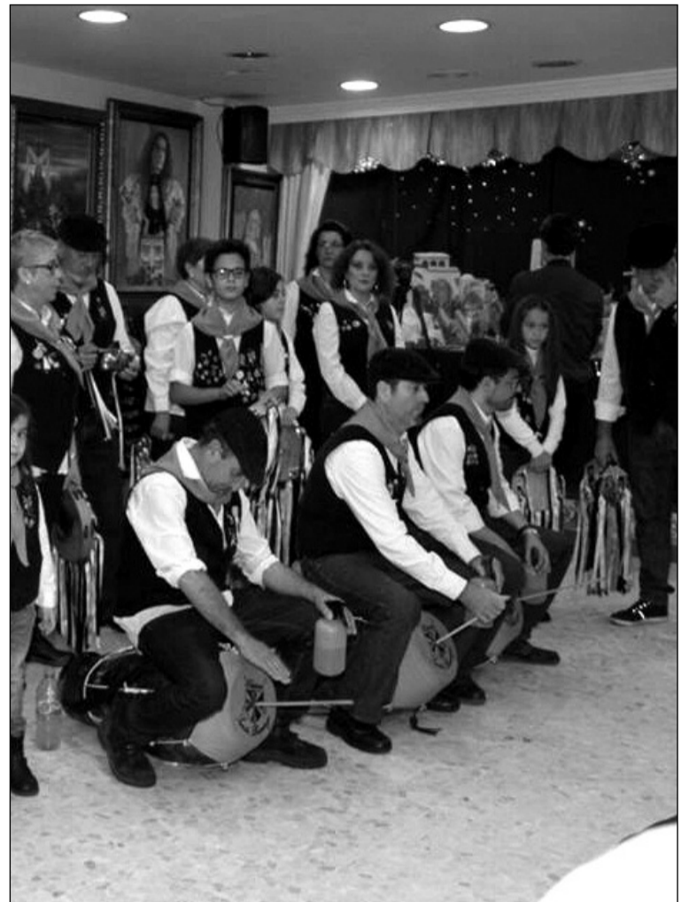
Un instante de la actuación de la pastoral.