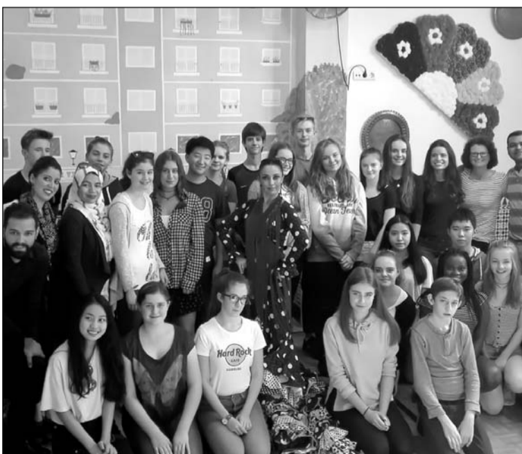
La bailaora, con algunos de los alumnos alemanes.