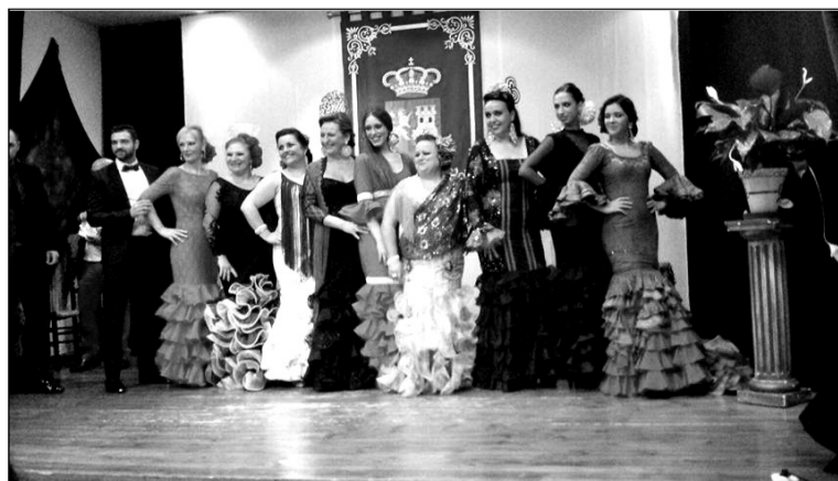
Participantes en la tercera de las semifinales del certamen de copla.