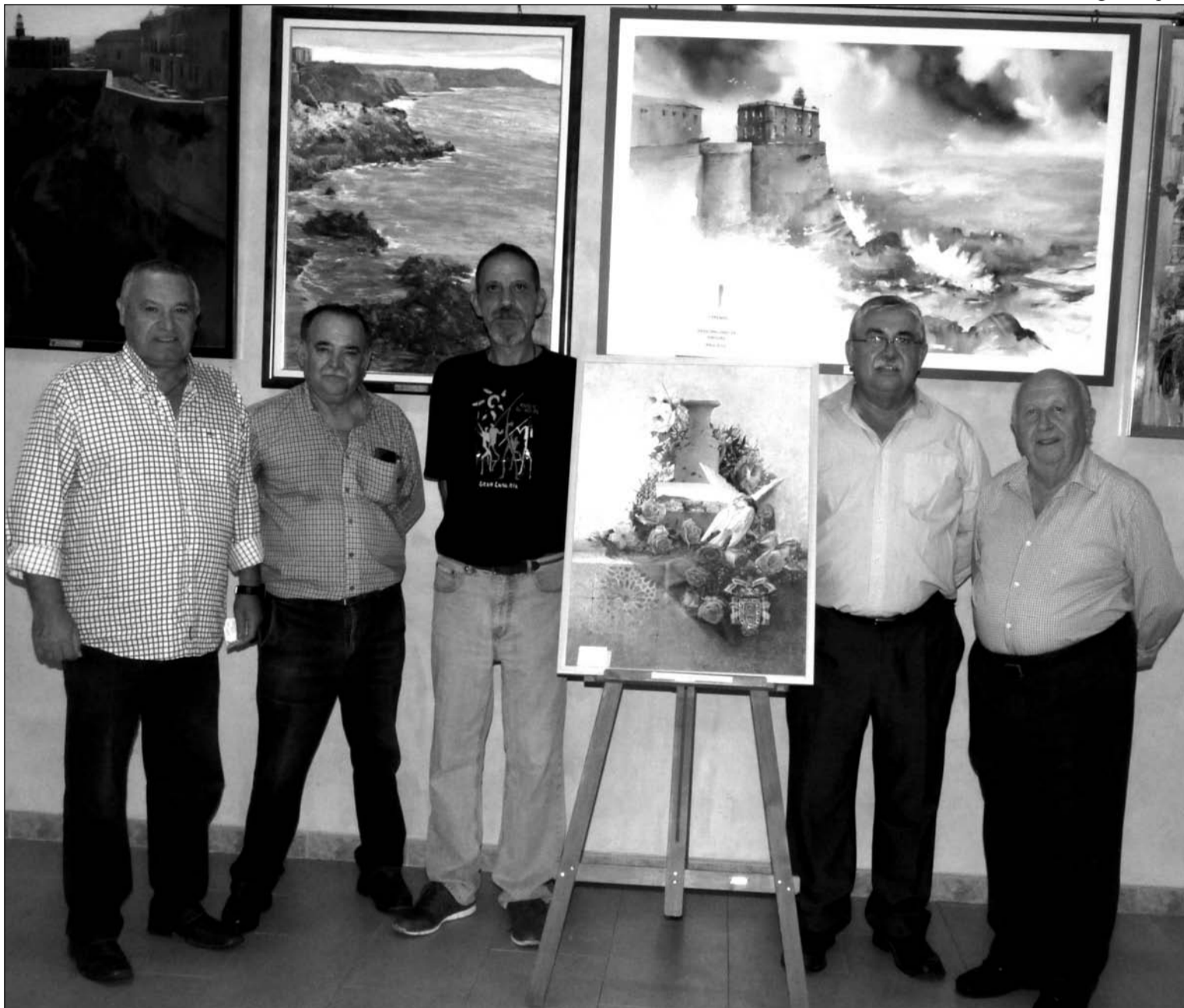
Miembros de la entidad con componentes del jurado del Concurso de Pintura.

Se trataba de una interesante propuesta para conocer esta zona del norte de España, con tantos tesoros e historia.