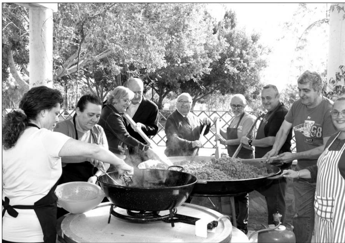
Peñistas, autoridades e invitados, ayudando a terminar las migas.