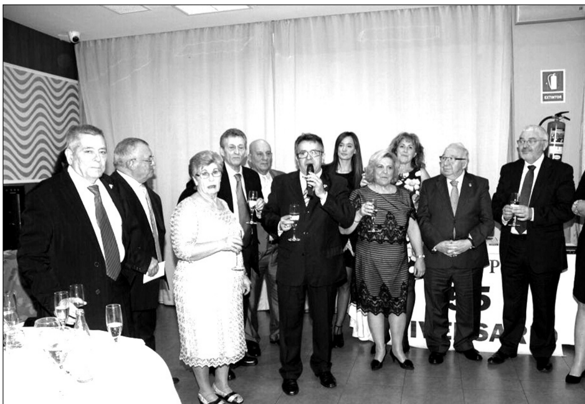
Instante en que se realiza el brindis entre todos los asistentes.