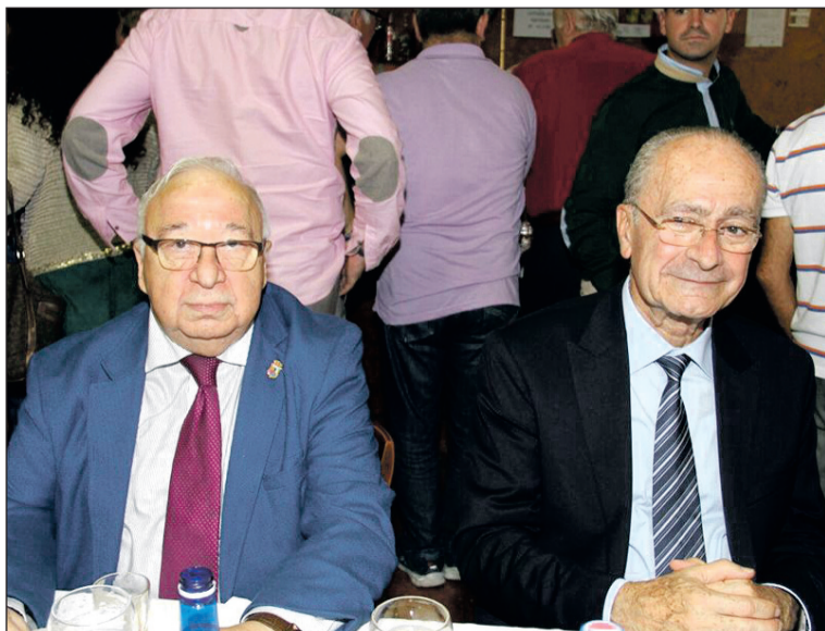
El presidente de la Federación, junto al alcalde de Málaga.