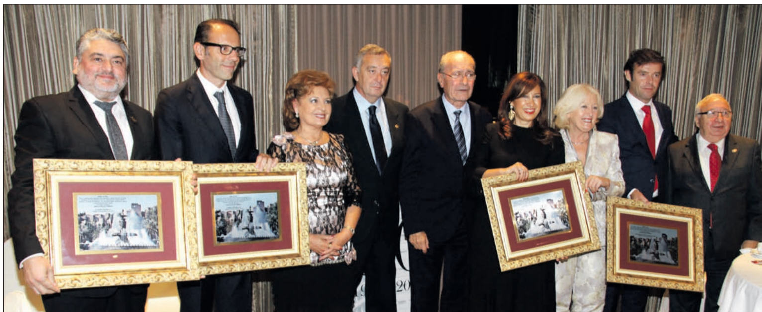
Galardonados junto a los encargados de hacer entrega de los premios.

La Peña La Paz celebraba el pasado 6 de noviembre una cena de gala en el hotel Málaga Palacio en la que se entregaban sus Premios Andaluces de Primera a la Cofradía de Jesús El Rico, el compositor Pedro Gordillo, la Delegación de Cultura del Ayuntamiento de Málaga, la emisora de Radio COPE, la Hermandad del Rocío de la Caleta y el establecimiento comercial La Gioconda.