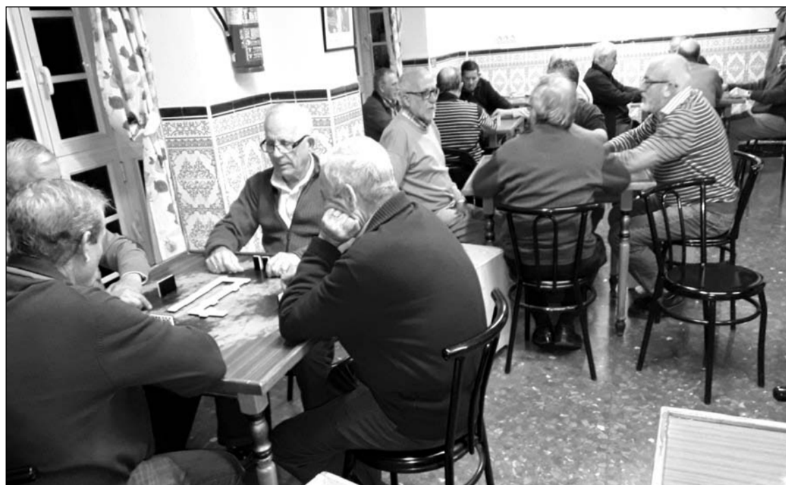
Desarrollo de las primeras partidas del campeonato de dominó.