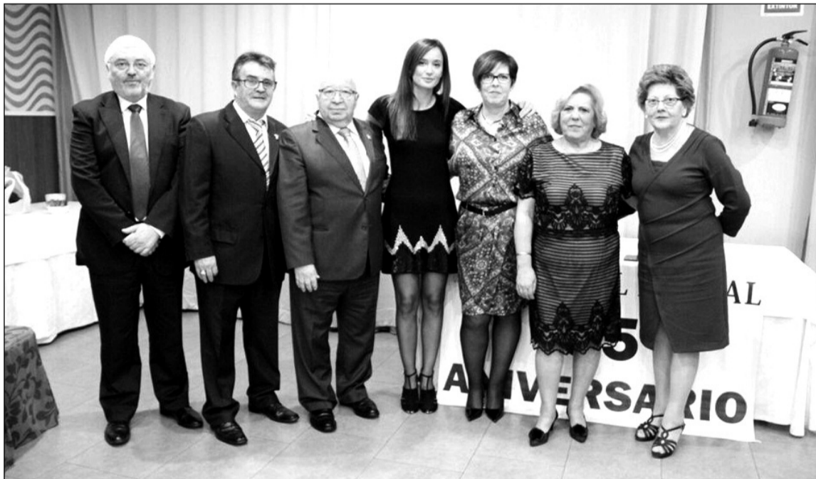
Asistentes al aniversario, durante el acto oficial.