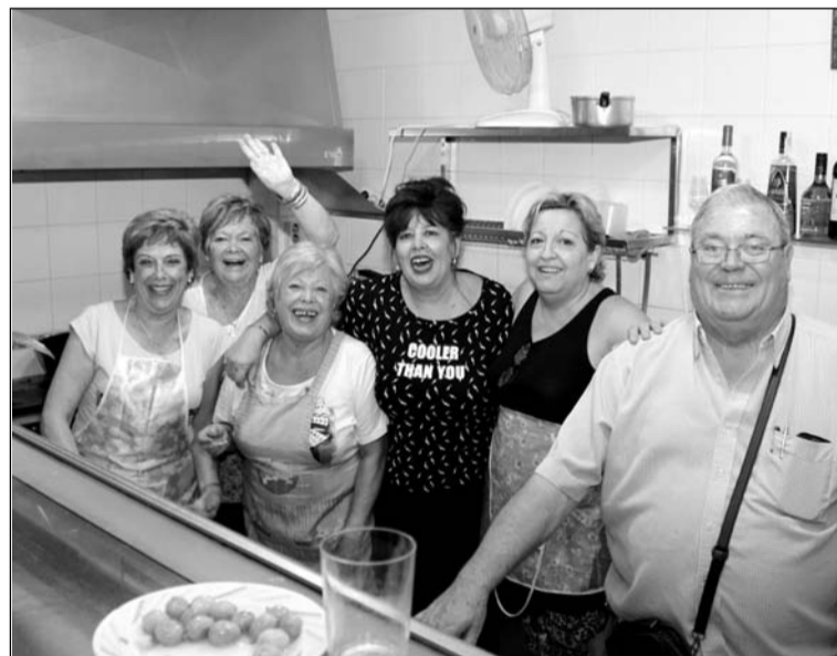
Socios preparando el almuerzo.