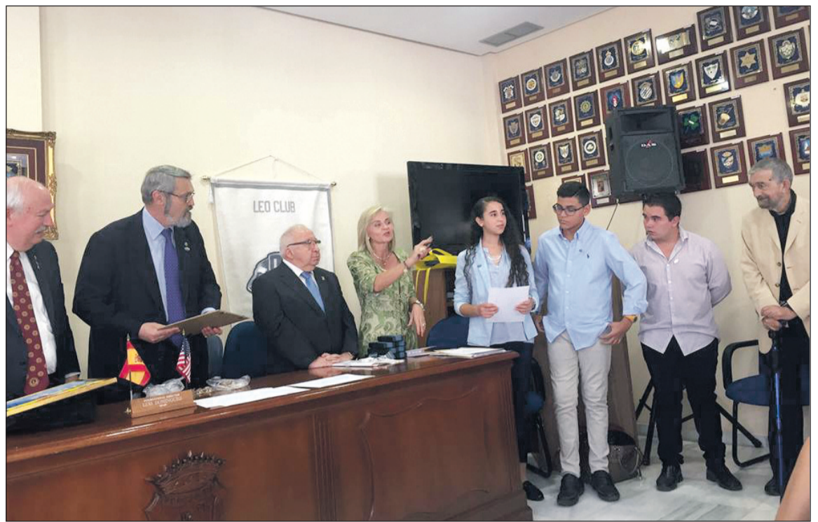
Un instante del acto celebrado en el salón de actos de la Federación de Peñas.

Los Leos de Fantasía le dedicaron una emotiva carta al presidente internacional y se le