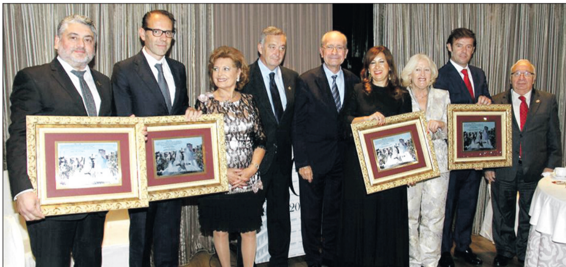
Acto de entrega de los premios Andaluces de Primera.