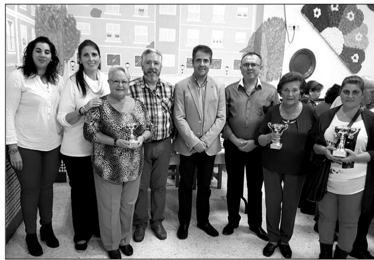
Acto de entrega de trofeos del Concurso de Tortilla.

Vecinos de Ciudad Jardín, iniciaba sus actividades del mes de noviembre el día 1 con la actuación en su sede de la gran bailaora malagueña Úrsula Moreno, para los alumnos de la Dresden International School de Alemania.