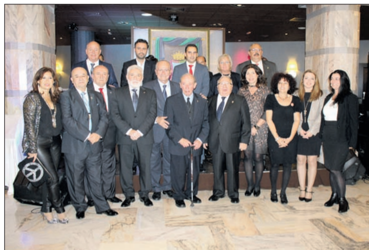
Autoridades con los galardonados en el Aniversario del pasado año.