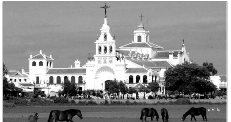
Vista de la aldea del Rocío.

El 24 de diciembre, como es habitual, se brindará por la Nochebuena; mientras que para Nochevieja se ofrece la posibilidad de que los socios acudan a la sede a celebrar la entrada del próximo año.