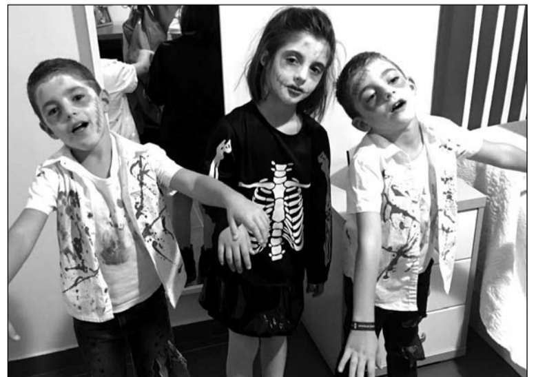
Pequeños zombis y muertos vivientes.