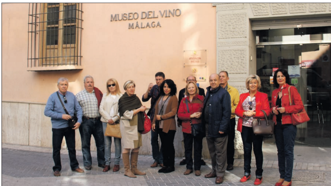
Algunos de los visitantes al Museo del Vino de Málaga.

Además, el Museo ofrece al visitante un amplio recorrido por la Historia, la geografía del vino y la viña en las zonas de producción vitivinícolas de la provincia y la elaboración, tipología y crianza de los vinos de licor y naturalmente dulces que conforman la D.O. Málaga, y de los blancos, tintos y rosados de la D.O. Sierras de Málaga