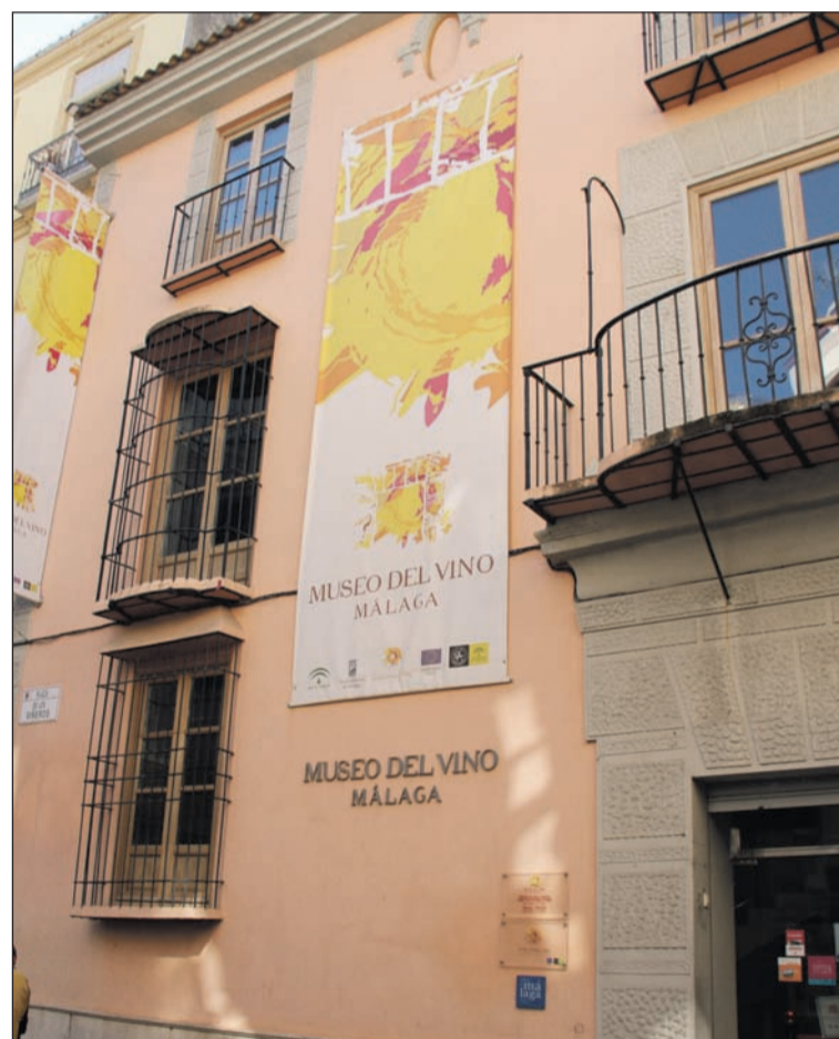
El Museo del Vino se encuentra en la plaza de Viñeros.

Entidades colaboradoras con esta publicación: