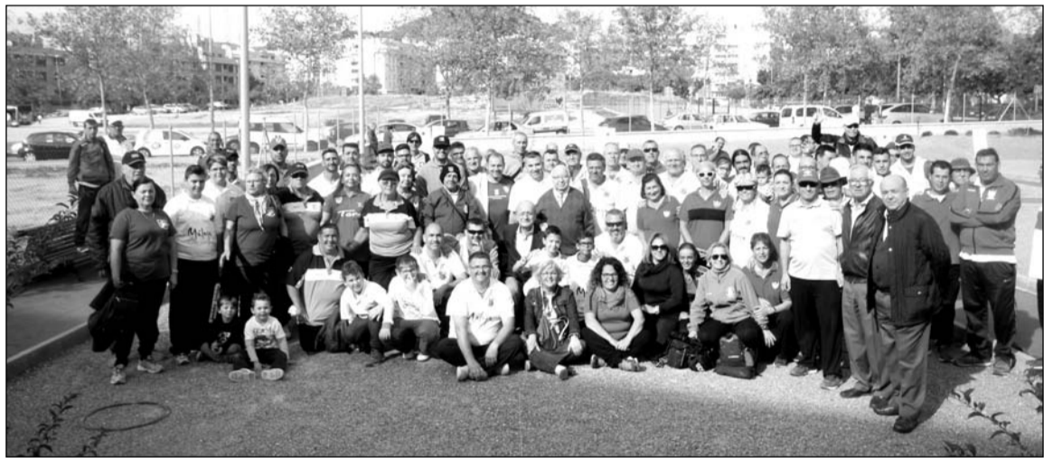
Participantes en la competición con las autoridades e invitados.