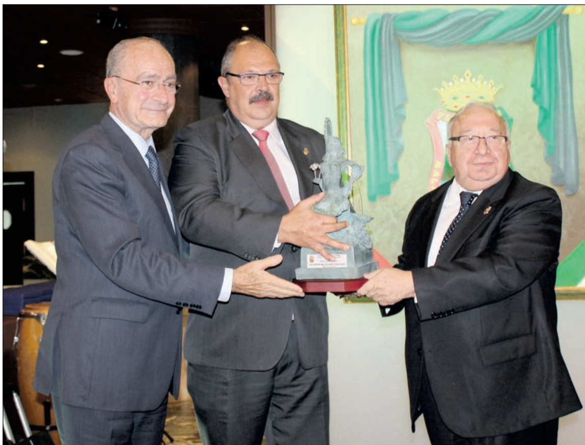
Entrega del Premio Malagueño de Pura Cepa en 2015