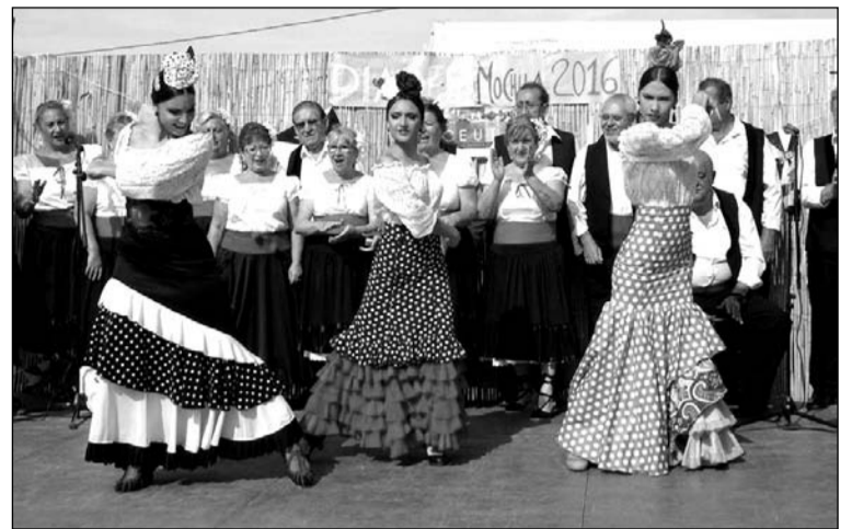
Muestra de folclore andaluz en la celebración de la Casa de Ceuta.

Uno de los factores que contribuyeron, en gran medida, a construir el carácter festivo de La Mochila fue el auge de agrupaciones como los Exploradores y las excursiones de los escolares al campo exterior, y de ahí surge las canciones, la talega para transportar los frutos secos y toda la parafernalia