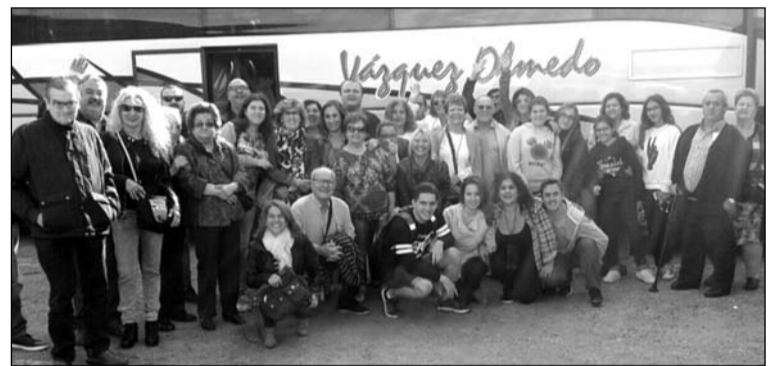
Socios que asistieron a la excursión a Úbeda.

de asociados a la bella localidad de Úbeda, en la provincia de Jaén.