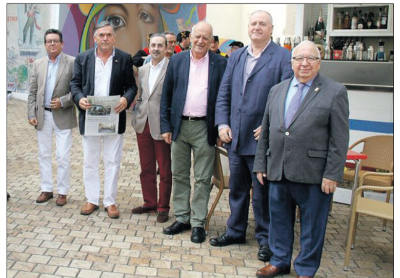
Algunos de los asistentes, entre ellos el presidente de la Federación de Peñas.