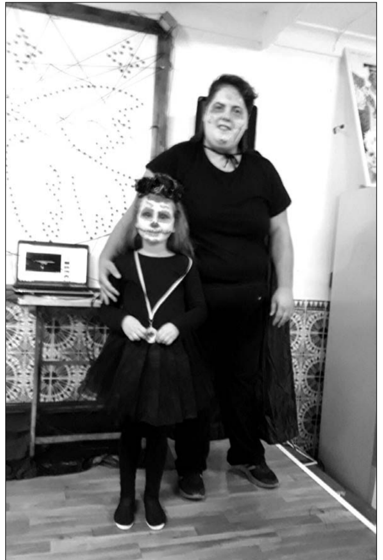
Personas de todas las edades participaron en la fiesta.

De hecho, pensando en los niños, se instaló un castillo hinchable, además de realizar el tercer Concurso de Disfraces, que gozó de una gran participación de socios y simpatizantes.