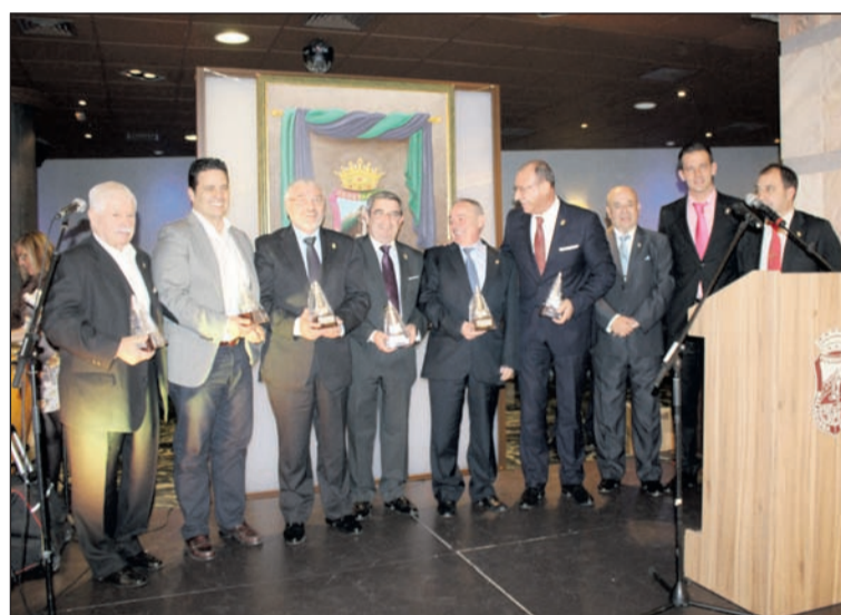
Recuerdo a las empresas patrocinadoras de la Federación de Peñas.