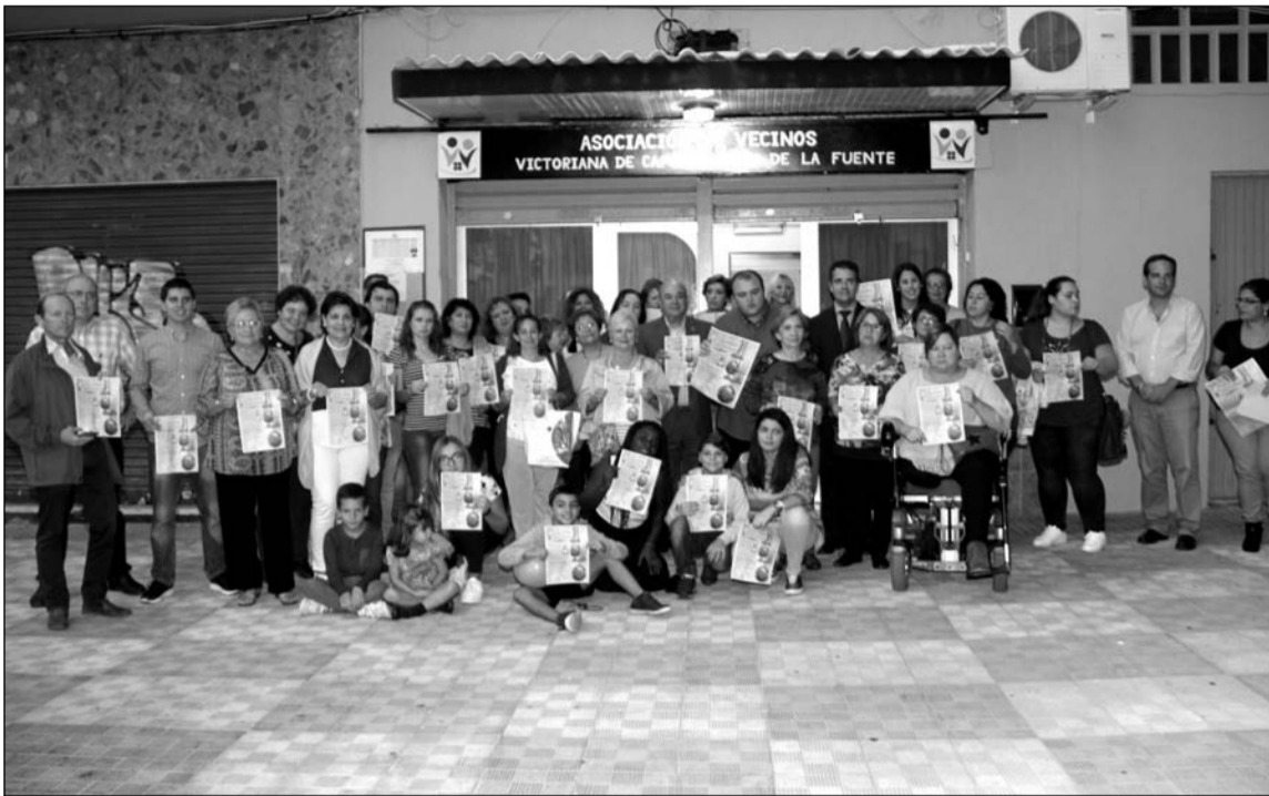
Presentación de la Campaña de Navidad en el exterior de la sede.