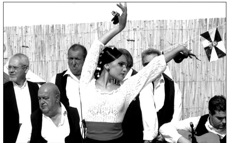
Un instante de la actuación.

Es en Ceuta el único lugar que se celebra esta tradición en esta fecha. Aunque muchos ceutíes que viven en la península, como los socios de la Casa de Ceuta en Alhaurín de la Torre, siguen celebrando la tradición allí donde se encuentren, es su forma de llevar a su tierra en el corazón.