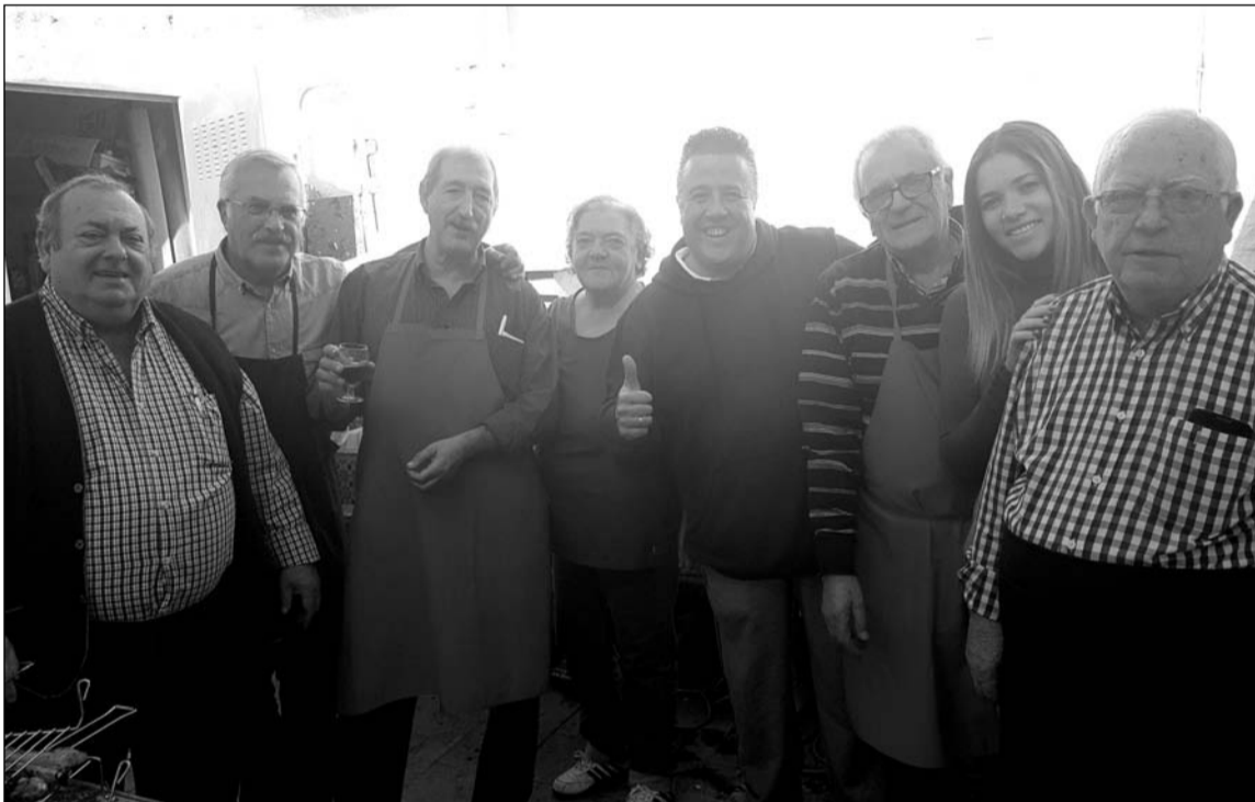
Socios de distintas edades disfrutando de la barbacoa.

Tras la barbacoa, momentos de sobremesa con charlas y debates que hacen muy amenas las tardes en la entidad.