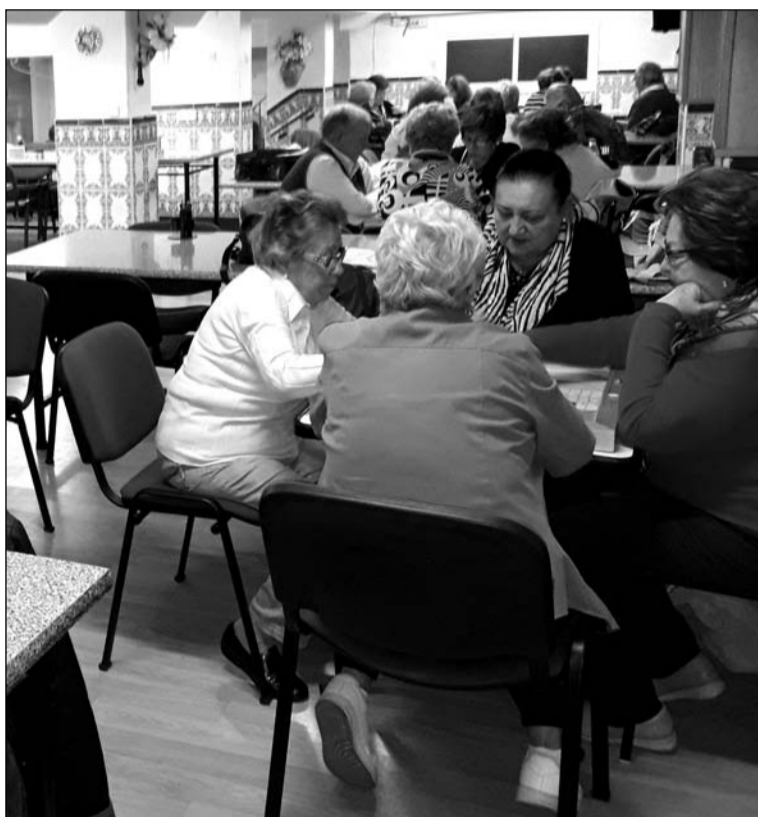
Grupo de socias jugando al parchís.