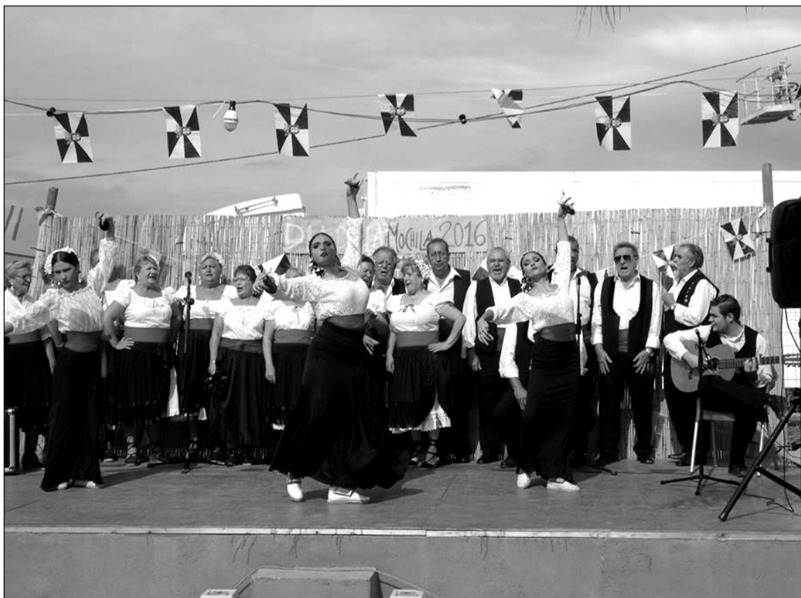
Un instante de la actuación de Raíces y Horizonte.