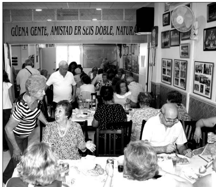
Ambiente durante la comida de hermandad.