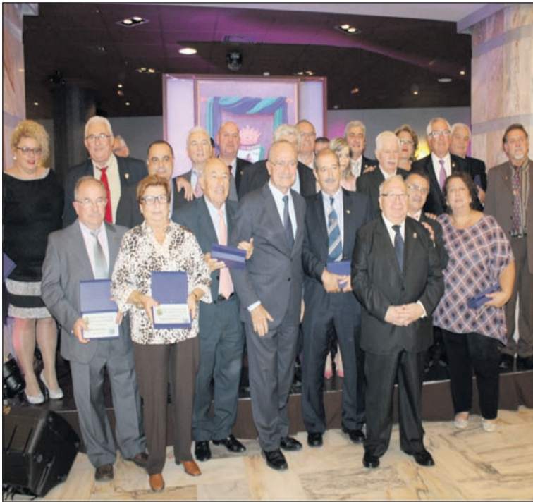
Presidentes de algunas de las entidades asistentes al aniversario del pasado año.