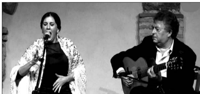
Imagen de archivo de Laura Vital, con Eduardo Rebollar al toque.

Esta cantaora gaditana, de Sanlúcar de Barrameda, es sin duda una de las grandes figuras del panorama flamenco joven en la actualidad, avalada por una treintena de premios Nacionales e Internacionales, destacando el Primer Premio en el Concurso Internacional de Arte Flamenco de la XI Bienal de Sevilla (2000), y por los innumerables espectáculos en los que participa.