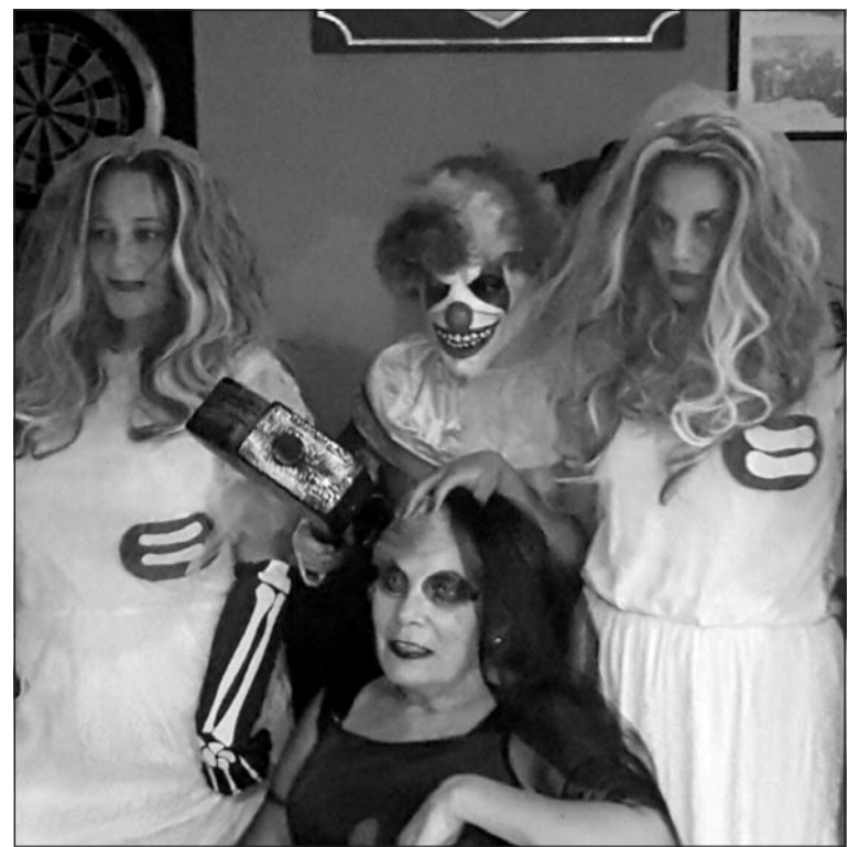
Se emplearon disfraces muy cuidados.