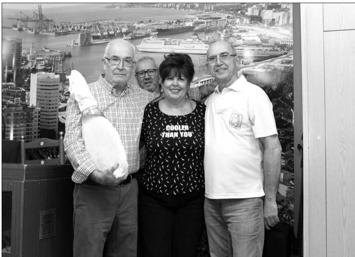
Los ganadores del torneo de dominó recibieron un jamón.

también se decidía por parte de la junta directiva que se hiciera entrega de trofeos de un campeonato de dominó que con anterioridad se había venido desarrollando en sus dependencias.