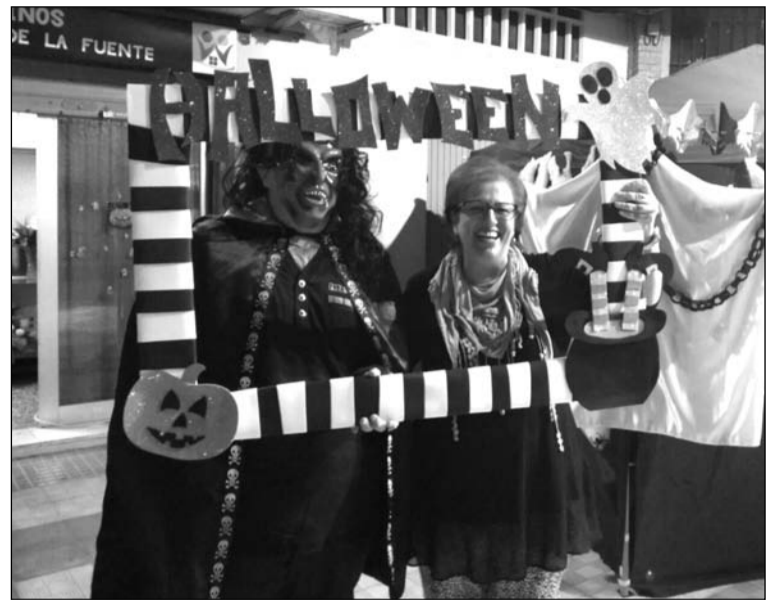
Fiesta de Halloween en la sede.

Además, el mes de noviembre se comenzaba con una excursión