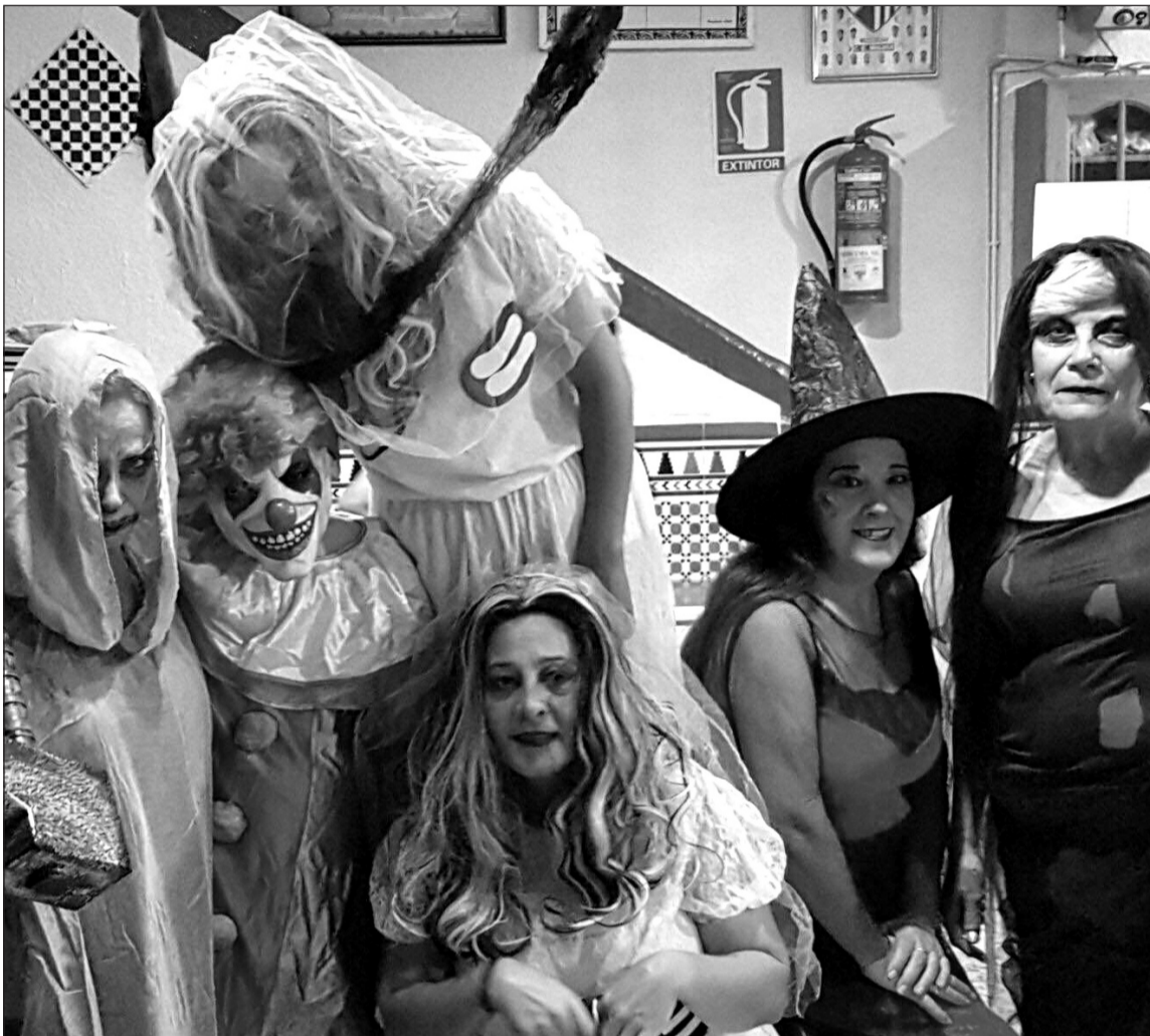
Socias disfrazadas en la Fiesta de Halloween.