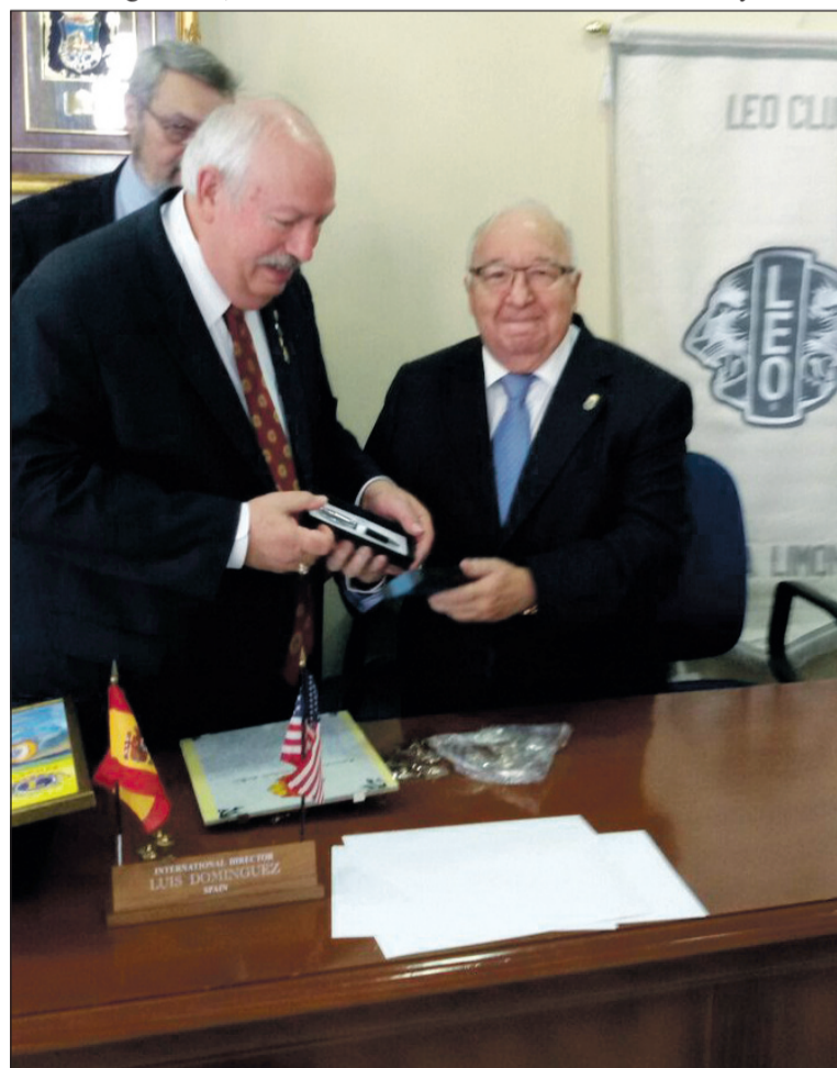
El presidente internacional de los Leones, con el presidente de la Federación.