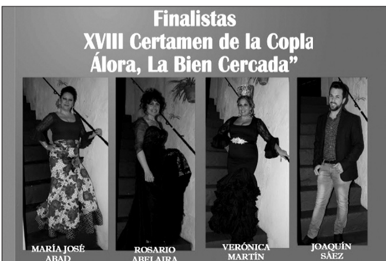
Finalistas del XVIII Certamen.