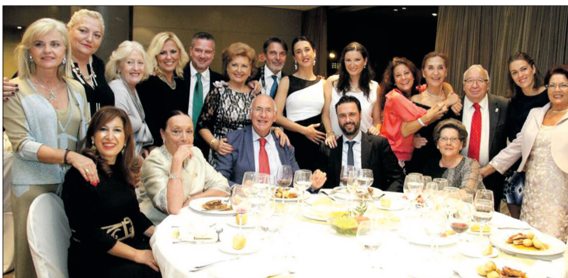
Autoridades e invitados asistentes al acto.