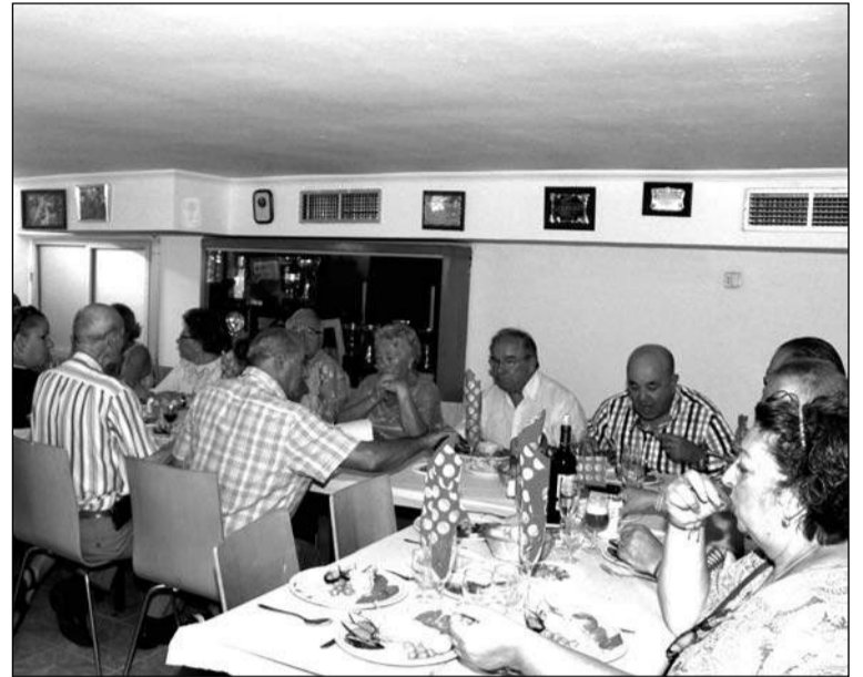
Un instante de la comida.

Este acto supuso también un refrendamiento de la hermandad de la Peña Palestina con otras entidades federadas, a las que se invitó a participar a partir de sus respectivos presidentes.