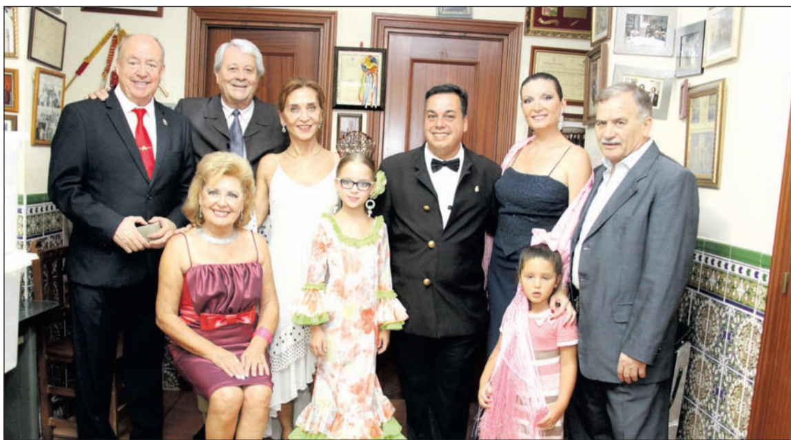
Asistentes al pregón del Certamen de Copla.