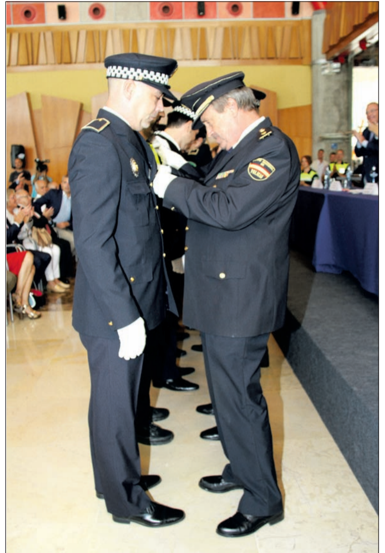
Acto de distinciones a miembros de la Policía Local.