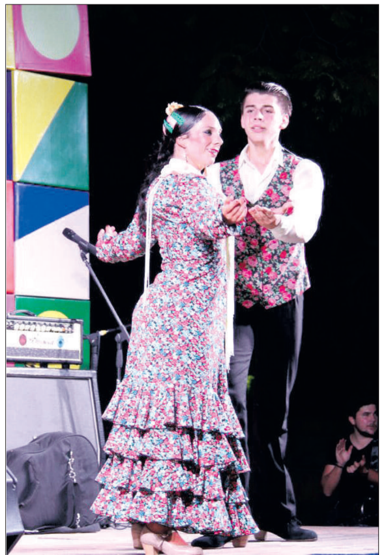
Un instante de la actuación flamenca.

Además, en este caso con la colaboración especial de la Peña El Palustre, se prepararon dos grandes paellas para todos los asistentes. También la gastronomía española cautivó a los alumnos extranjeros, que pacientemente aguardaron su turno para degustar este plato tan típico que se elaboró con la colaboración de Paelleros Sin Fronteras.