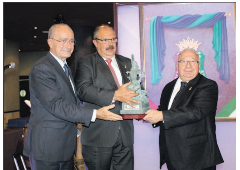
La Cofradía del Rocío fue Malagueña de Pura Cepa 2015.