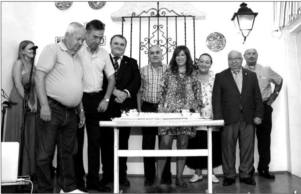
Instante en que se procedió a cortar la tarta conmemorativa.