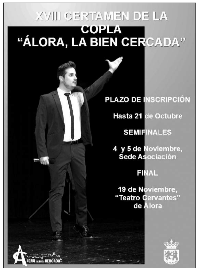
Cartel del certamen.

Asimismo, siempre por motivos justificados, la organización podrá cambiar las fechas y bases comprometiéndose a notificarlo a los participantes.