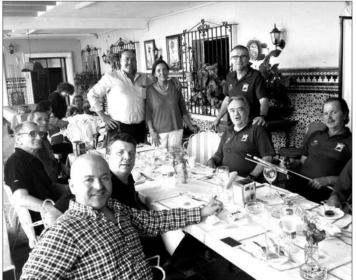
Convivencia tras la partida con el equipo de Córdoba en la terraza de la sede.

Además, el viernes 21 habrá baile en el salón Miguel de los Reyes de 19 a 22 horas, y el vier-