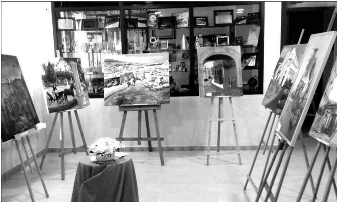
Algunos de los trabajos presentados al certamen pictórico.