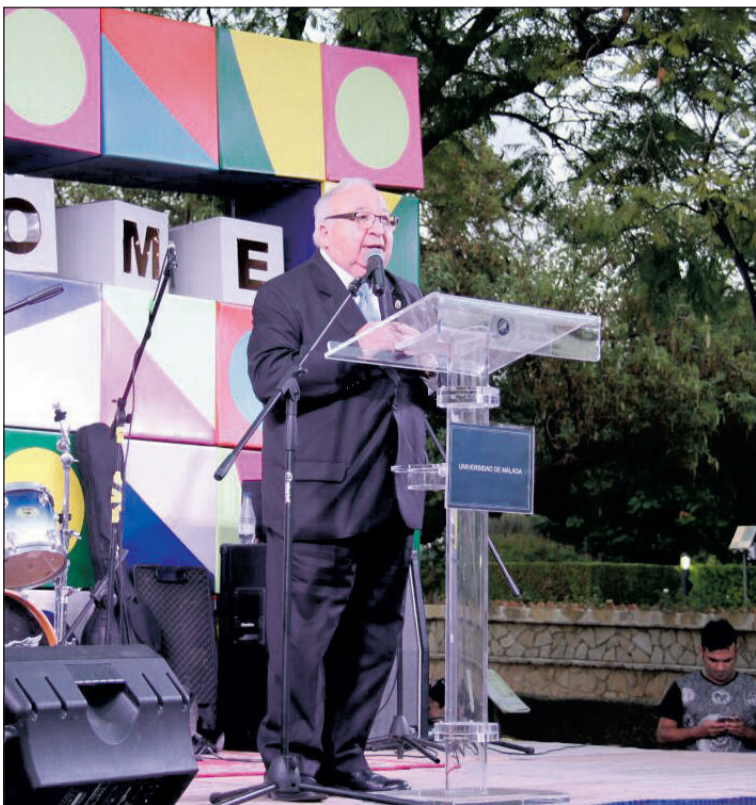
Intervención del presidente de la Federación en el acto institucional.