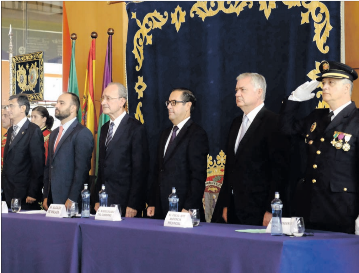
Autoridades que presidieron este acto.