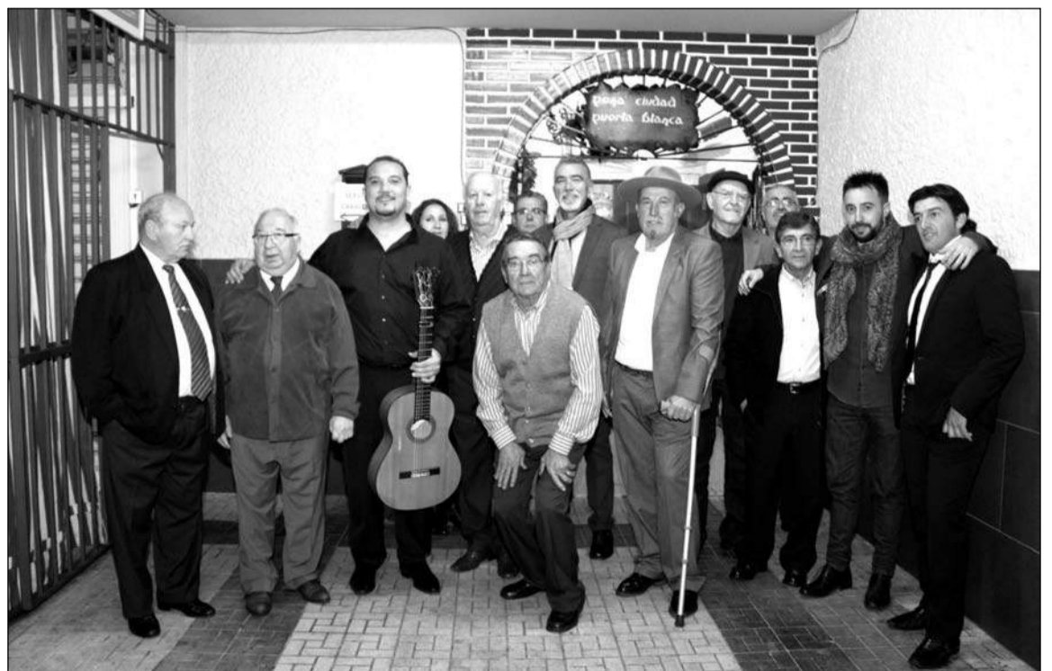
Imagen con los finalistas del concurso de cante flamenco de este año.

Como adelanto al mes de noviembre, ya se anuncia para el día 5 unas Berzas Flamencas en el transcurso de las cuales se procederá a la presentación del cartel de XXVIII Concurso de Cante Flamenco 'Ciudad de Málaga'.