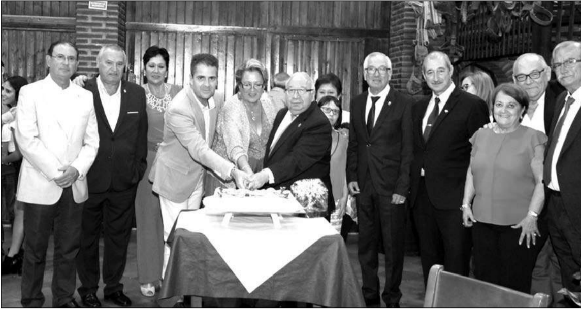
Corte de la tarta conmemorativa del aniversario.