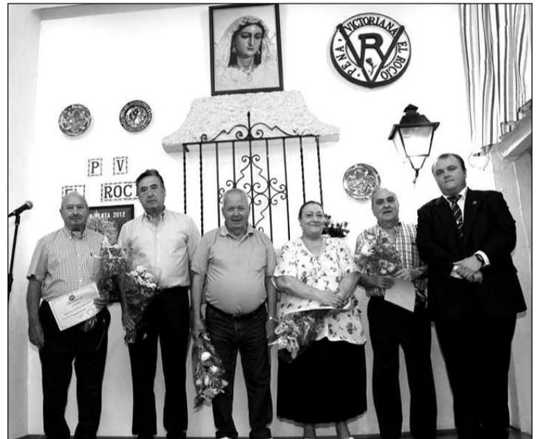
Entrega de distinciones de la Peña Victoriana El Rocío.