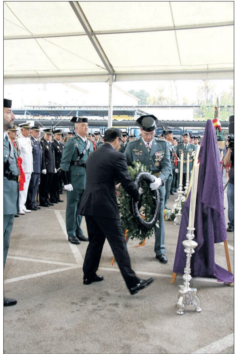
El subdelegado y el coronel hacen entrega de una corona de laurel.