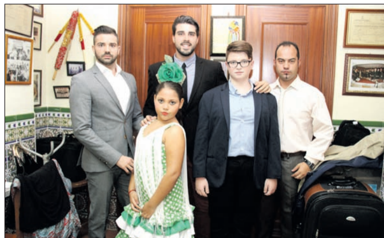
Participantes en la primera semifinal del certamen de copla.