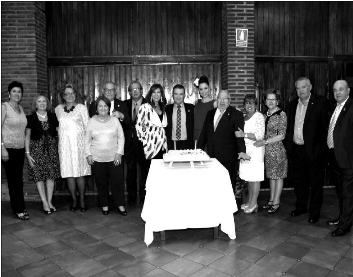
Asistentes al acto ante la tarta conmemorativa del aniversario.