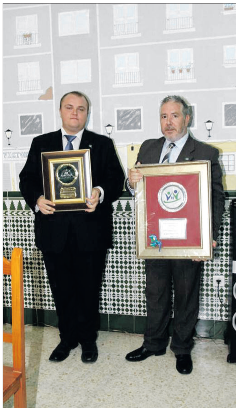
Los presidentes de las dos asociaciones, con los recuerdos que se intercambiaron.

Entidades colaboradoras con esta publicación: