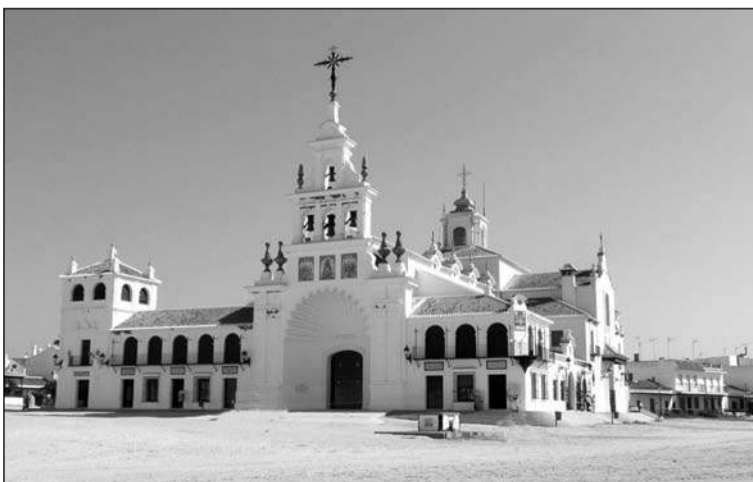
Vista de la aldea del Rocío.