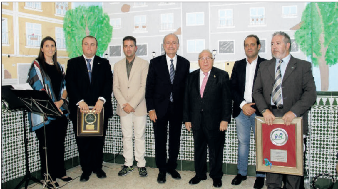
Representantes de las entidades con las autoridades asistentes al acto.

Socios de ambas entidades federadas acudieron a un acto de convivencia entre vecinos, y en el que no faltó la música en directo con diferentes actuaciones.