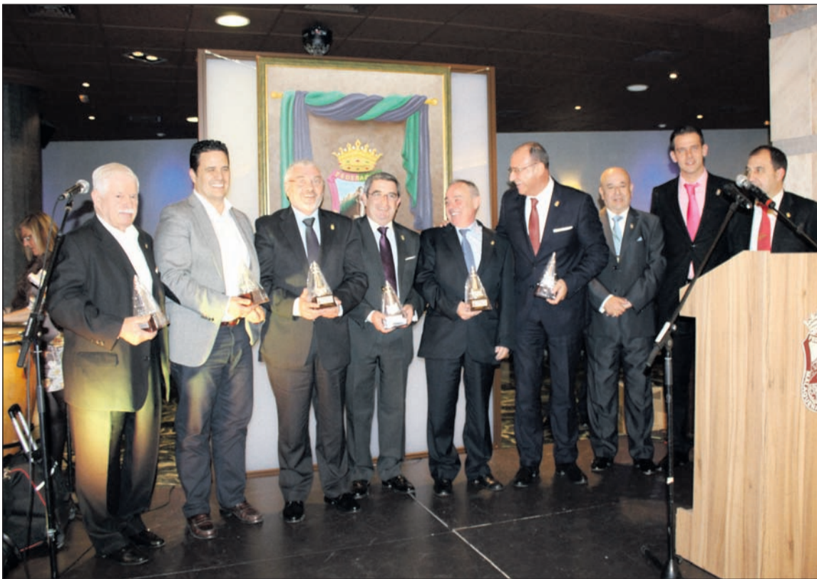
Entrega de reconocimiento a patrocinadores en el aniversario del pasado año.

dos con Málaga en los diferentes medios de comunicación en los que colabora: la Cadena Cope y PTV. Esta distinción se viene a unir a la reciente designación como pregonero de la próxima Semana Santa de Málaga 2017 por parte de la Agrupación de Cofradías.