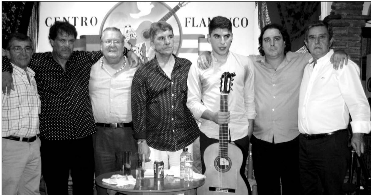
Artistas flamencos con socios de esta entidad federada.