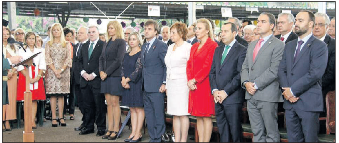
Autoridades asistentes al acto.

La intervención de la Benemérita en rescates, accidentes, incendios o inundaciones fue alabada por el subdelegado, quien explicó la “ardua tarea” de los agentes que cubren un 70 por ciento del territorio de la provincia y que en lo que va de año han llevado a cabo más de 75 rescates por tierra, mar y aire.