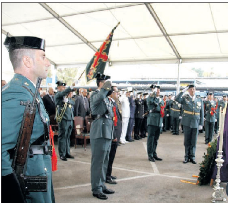
Un instante del acto celebrado en la Comandancia de la Guardia Civil.