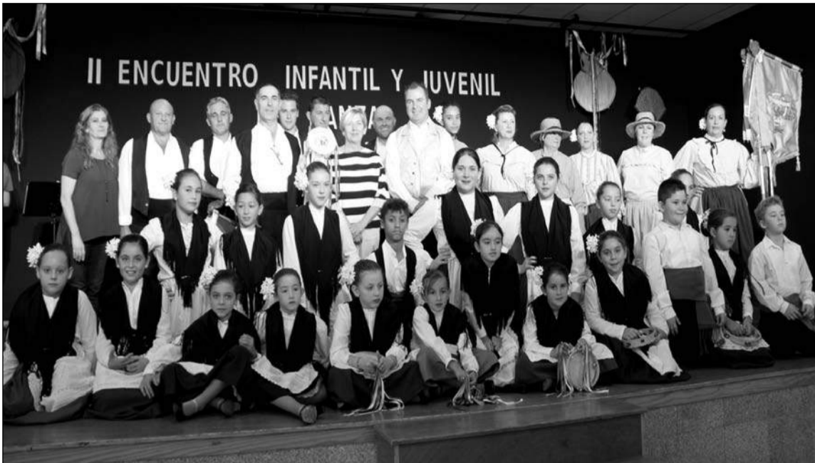
Una imagen del acto celebrado en la caseta municipal de Torremolinos.