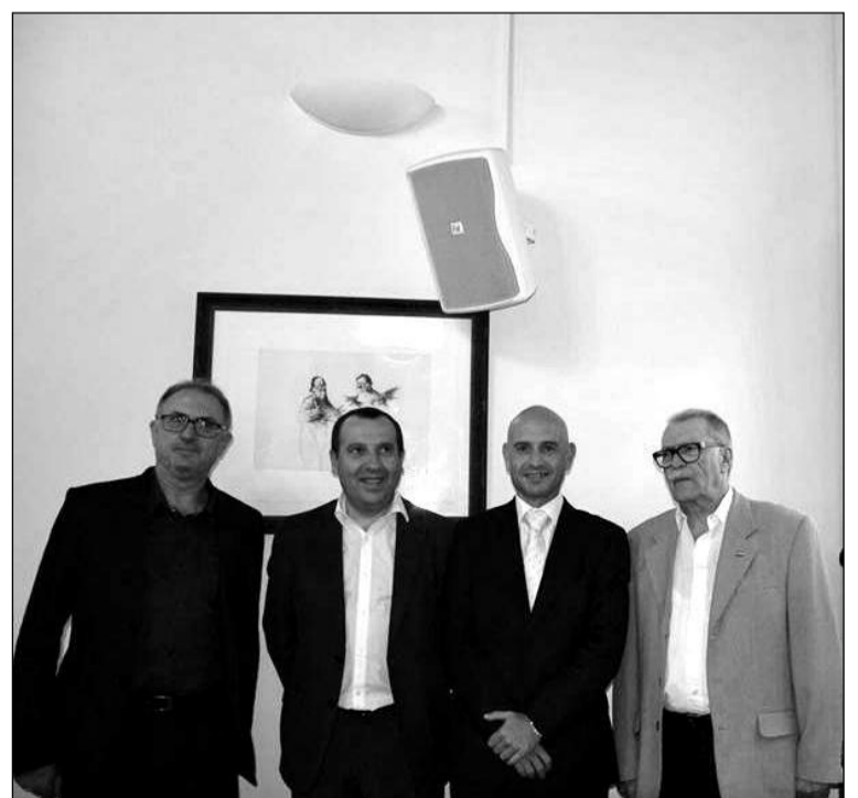
Participantes en el acto celebrado en el Ateneo.

1996 bar restaurante Alba, reciente ganador del Concurso de Tapas Carta Malacitana celebrado en la VIII Fiesta de la Cabra Malagueña de Casabermeja fue el encargado de elaborar el chivo ganador.