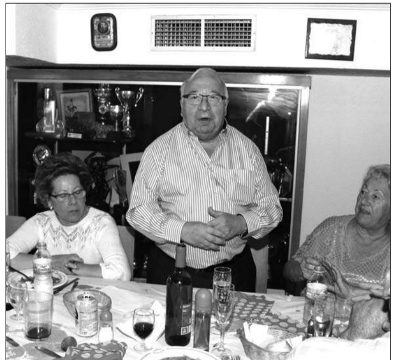
Intervención del presidente de la Federación, Miguel Carmona.