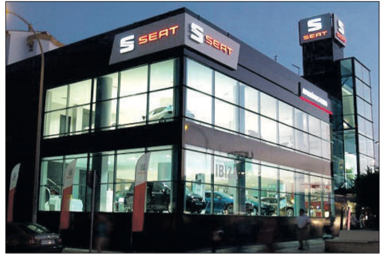
Instalaciones de Automóviles Rueda en Avenida de Velázquez, Málaga.