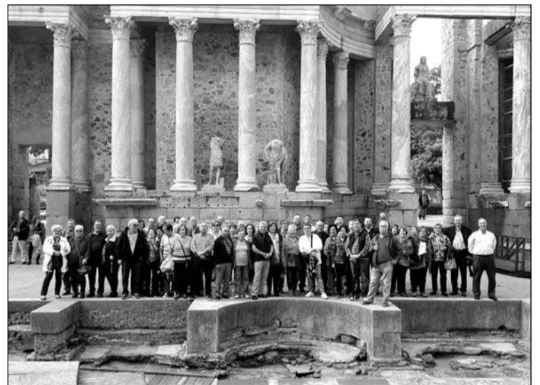
Grupo en el teatro romano de Mérida.

Seis días de viaje aprovechados al máximo, sin incidentes y con el deseo de organizar el próximo.