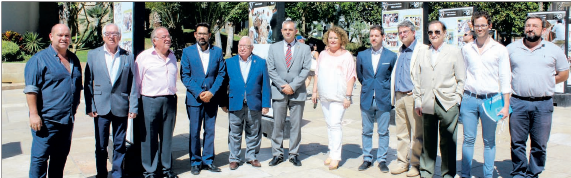
Acto de inauguración de la exposición de paneles instalados en la calle Alcazabilla.