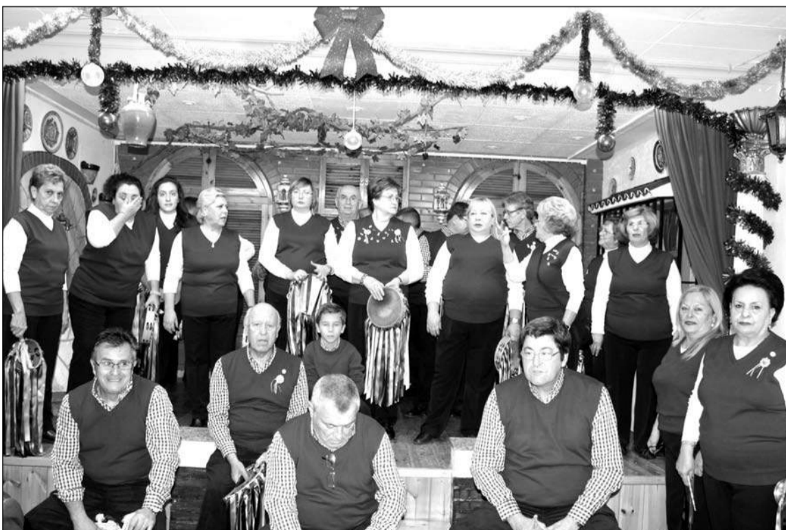
Imagen de archivo de la Pastoral de la Peña El Parral, que en breve iniciará sus ensayos.