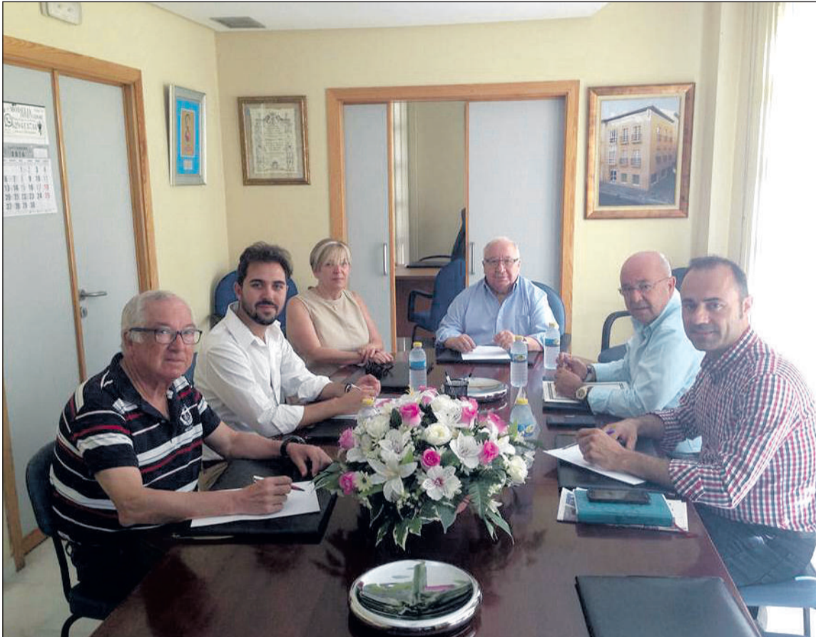
Un instante de la reunión mantenida en la sede de la Federación de Peñas.