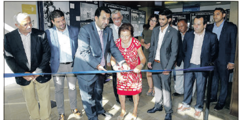
Inauguración de la exposición, con la presencia del jeque Al Thani.

El Museo&Tour MCF de la Rosaleda acoge la primera parada de esta exposición, donde permanecerá abierta al público hasta el próximo mes de febrero de 2017. A partir de esta fecha, la Diputación llevará la muestra al centro de la capital y los aficionados podrán disfrutar del recorrido visual en diferentes puntos de la provincia.