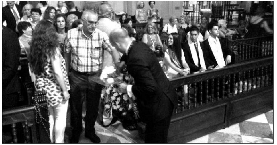
Algunas entidades, pese a no contar con reina, también quisieron realizar su ofrenda.