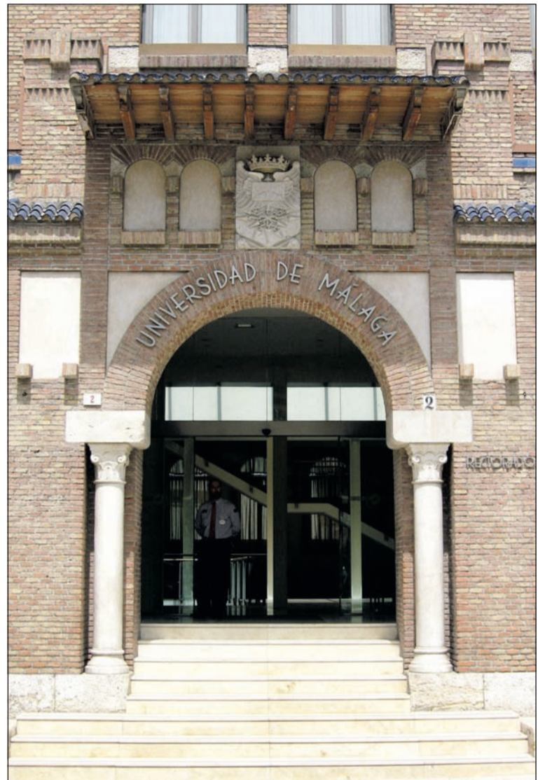
Acceso a la sede de la Universidad de Málaga.