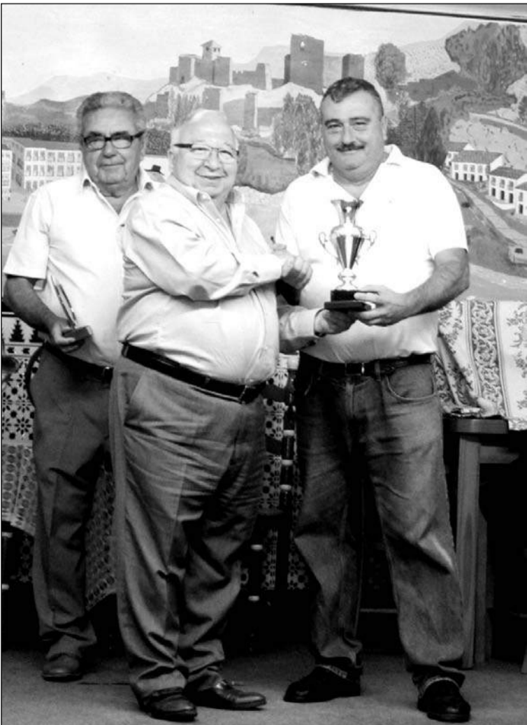
El presidente de la Federación hace entrega de uno de los trofeos.