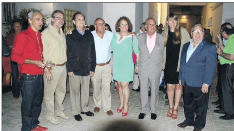
Invitados a la inauguración de la escultura.