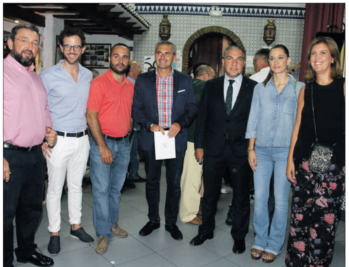
Autoridades asistentes a la presentación de la obra.