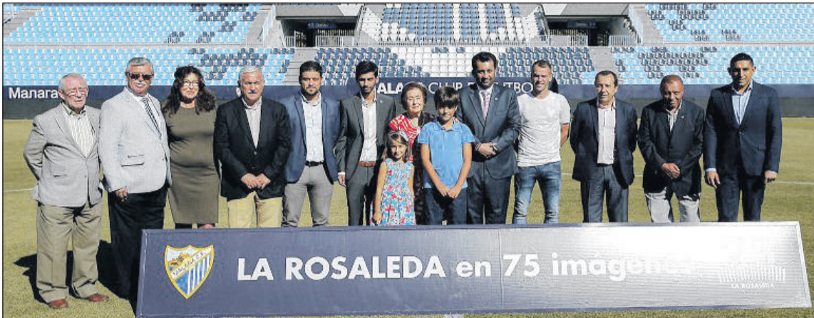
Asistentes a la inauguración de la exposición, sobre el césped de La Rosaleda.