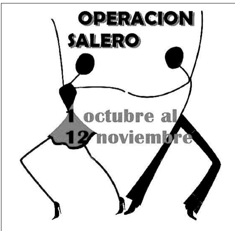
Cartel diseñado para esta actividad.