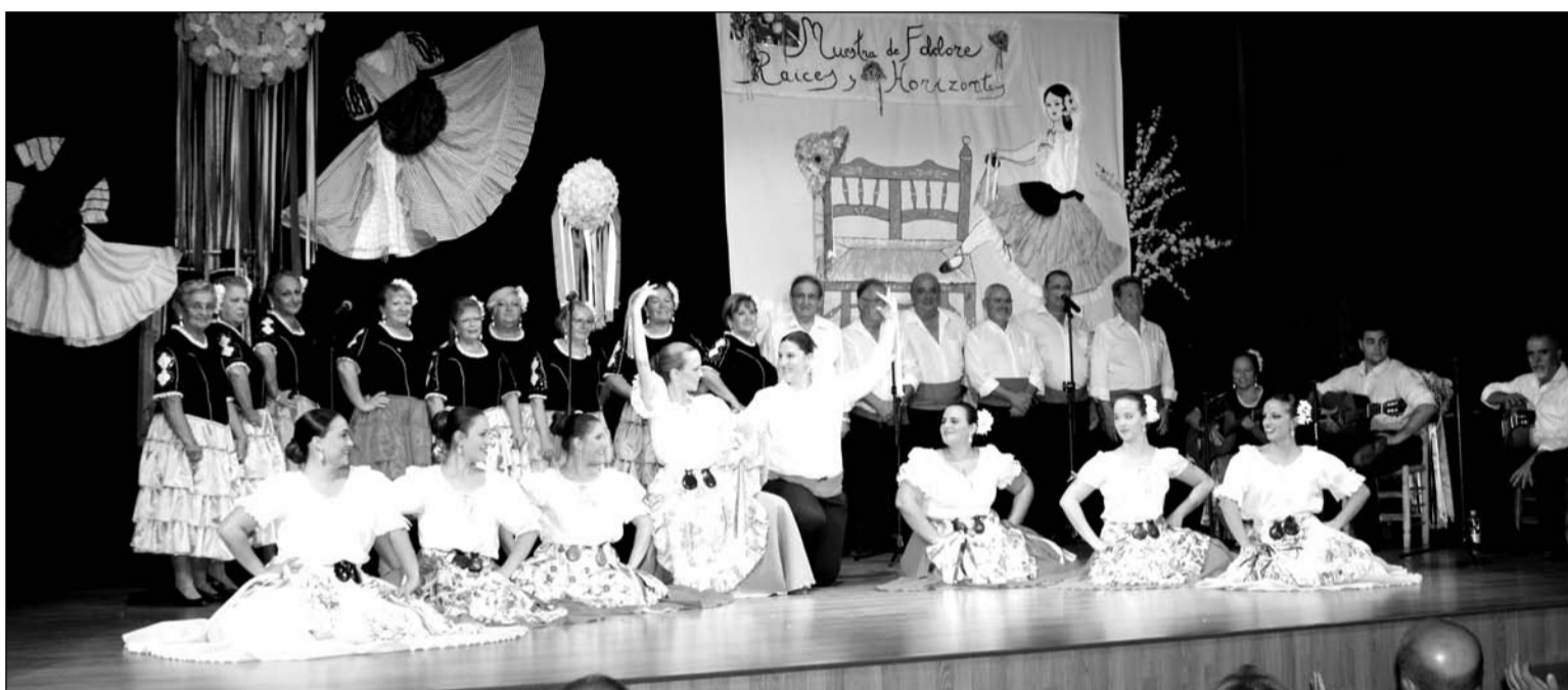
Un instante de la muestra de folclore celebrada en el Centro Cultural de Alhaurín de la Torre.