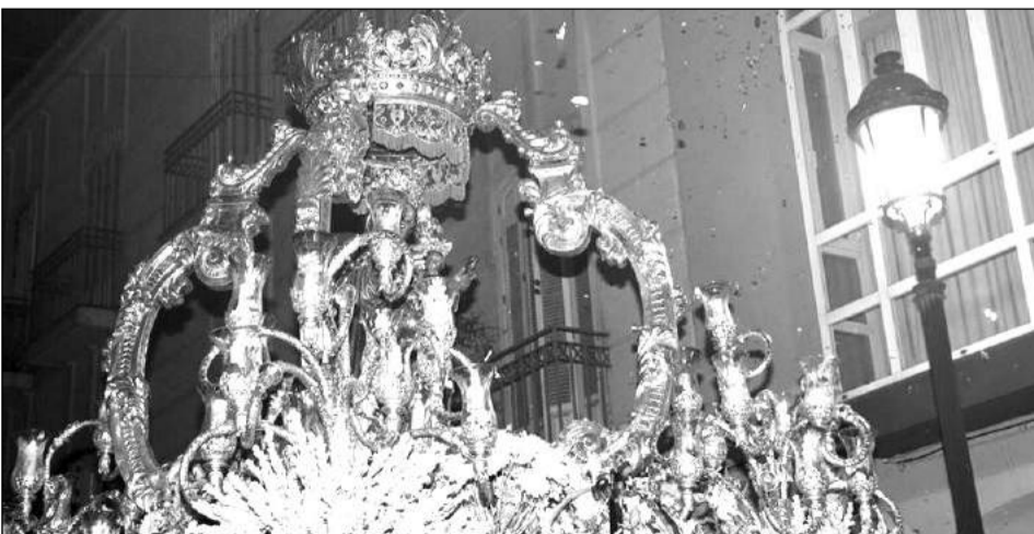
Petalada desde los balcones de la Federación de Peñas al paso del trono de la Patrona.