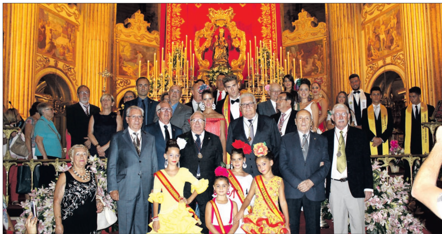
Ofrenda floral realizada por la Federación de Peñas el pasado 6 de septiembre a Santa María de la Victoria en el altar mayor de la Catedral.

Número 608 21 de Septiembre de 2016 C/ Pedro Molina, 1 Tfno: 952 22 54 39 Fax: 952 21 48 82 E-mail: prensa@femape.com - la_alcazaba@hotmail.com Web: www.femape.com Edición digital: www.femape.com/laalcazabadigital Twitter: @FMPLaAlcazaba Facebook: www.facebook.com/FMPLaAlcazaba