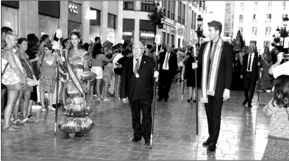
La Reina y el Mister, con el presidente de la Federación, por la calle Larios.