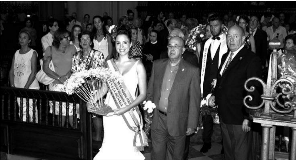
La Reina de la Biznaga, como es tradicional, ofreció jazmines.