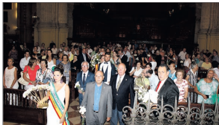
La Catedral, llena en la ofrenda floral.