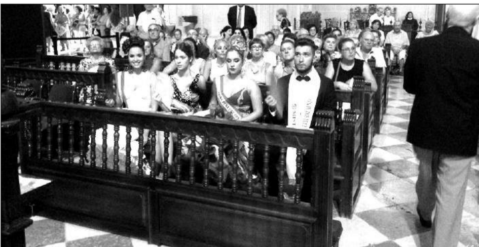
Se contó con la asistencia de representantes de numerosas entidades.