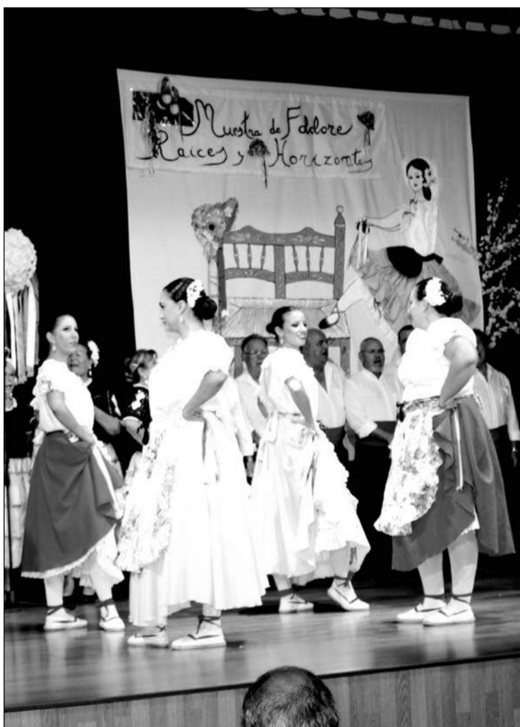
Un momento del espectáculo.