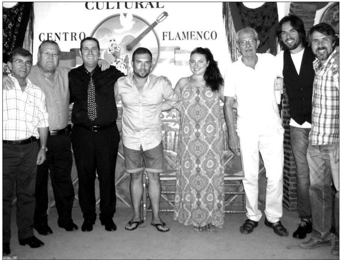
Socios de la entidad con los artistas flamencos.