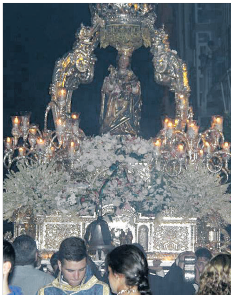
Santa María de la Victoria, en su trono procesional.