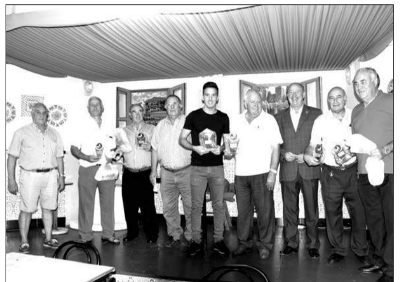
Ganadores de los torneos organizados por la Peña Cruz de Mayo.