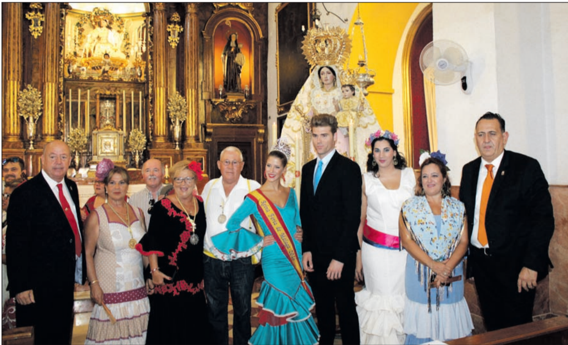
Representación peñista ante la Virgen de la Alegría antes de iniciarse su romería.