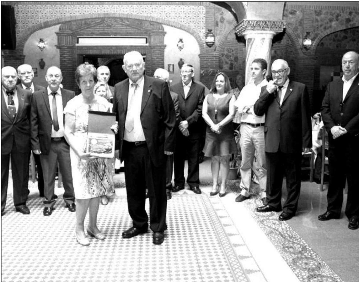
Acto de entrega de reconocimientos y distinciones.