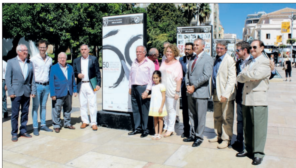
Acto de inauguración de la exposición de paneles que se puede visitar en la calle Alcazabilla.

El 19 de septiembre, a las 20:30 horas se inauguraba una escultura conmemorativa de los Concursos de Albañilería en la Plaza del Padre Ciganda, lugar de celebración de este concurso.