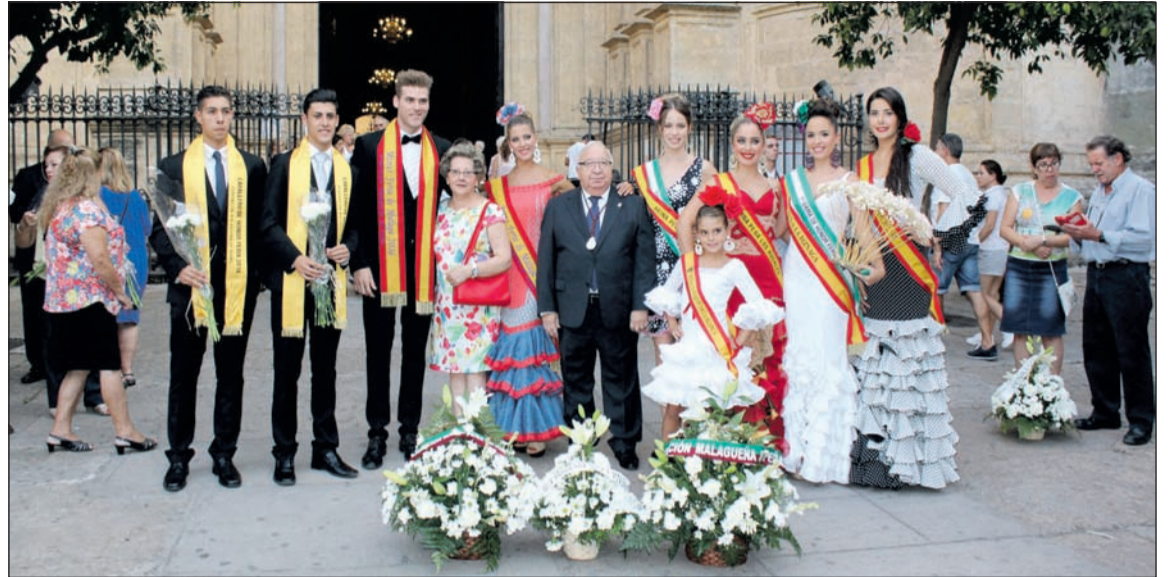
La Reina y el Mister estuvieron acompañados por sus Damas y Caballeros de Honor.