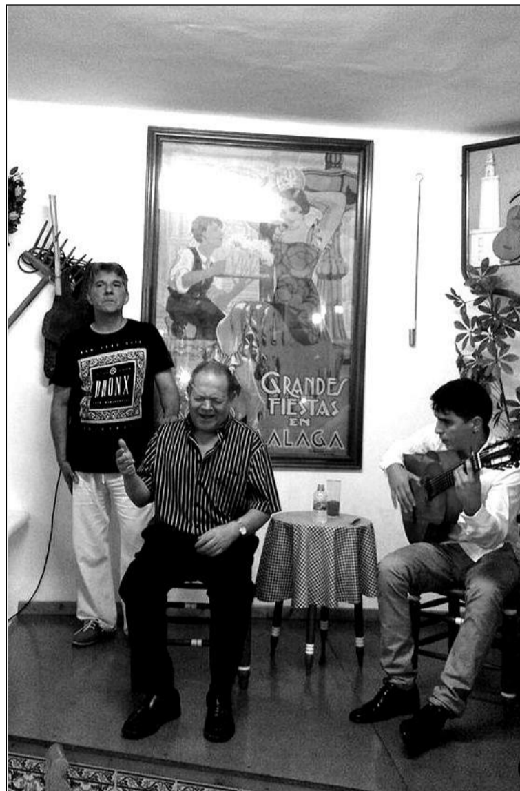
Un instante del recital flamenco.