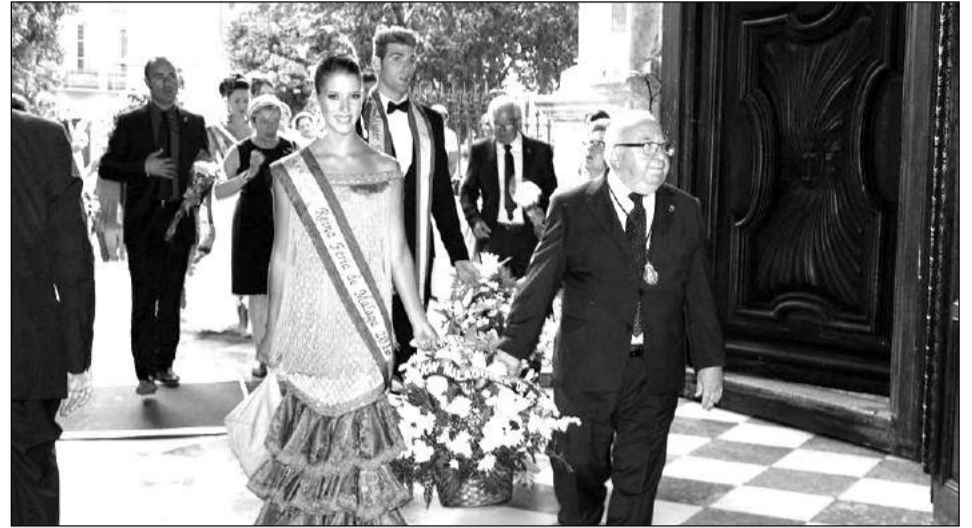
La comitiva peñista accedió a la catedral por el Patio de los Naranjos.