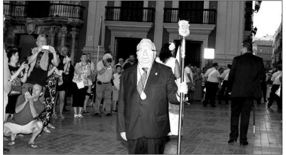
El presidente Miguel Carmona, al paso del cortejo por la plaza del Obispo.