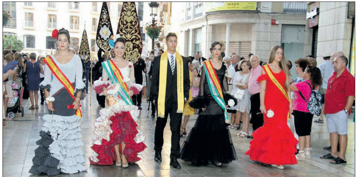
Damas de Honor con un Caballero de Honor durante la procesión.

En un sueño del rey, un anciano intercedía y pedía ante la Virgen por la consecución de la conquista. Ese mismo día llegaron a las estancias reales unos religiosos enviados por San Francisco de Paula, para pedir el permiso de fundación en España de la Orden de los Frailes Mínimos. Al mismo tiempo llevaban una carta del fundador en la que a modo de profecía indicaba al rey, que no levantara el cerco porque en tres días la ciudad caería en sus manos. El monarca entendió su sueño