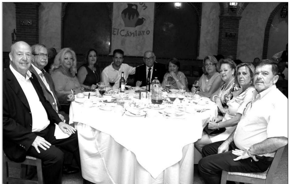
Mesa presidencial durante el XX Aniversario.

Finalmente, se cortó una tarta conmemorativa del XX Aniversario, con brindis por parte de todos los asistentes.