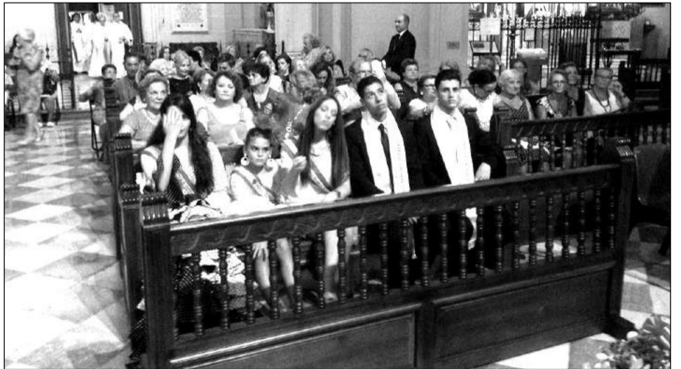
Jóvenes participantes en la ofrenda.