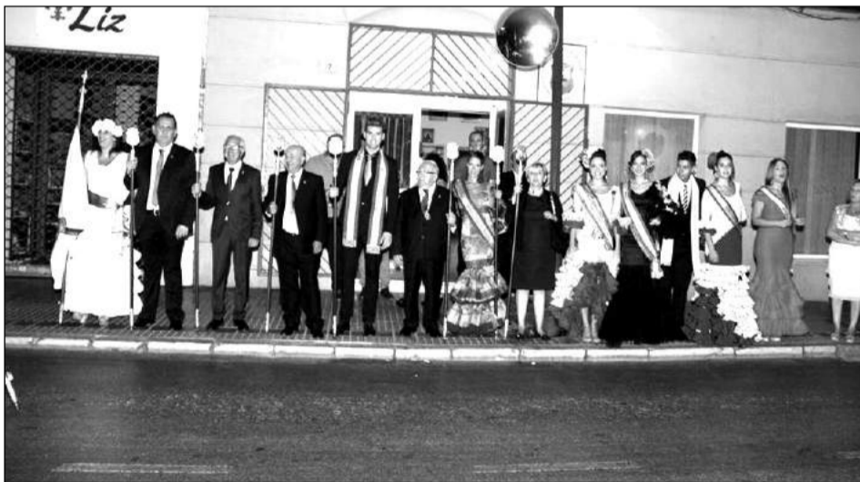
La representación peñista aguarda el paso de la Victoria por la sede de la Federación.