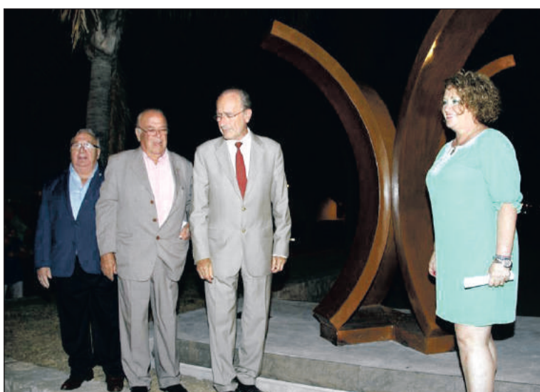
El alcalde asistió a la inauguración de la escultura.