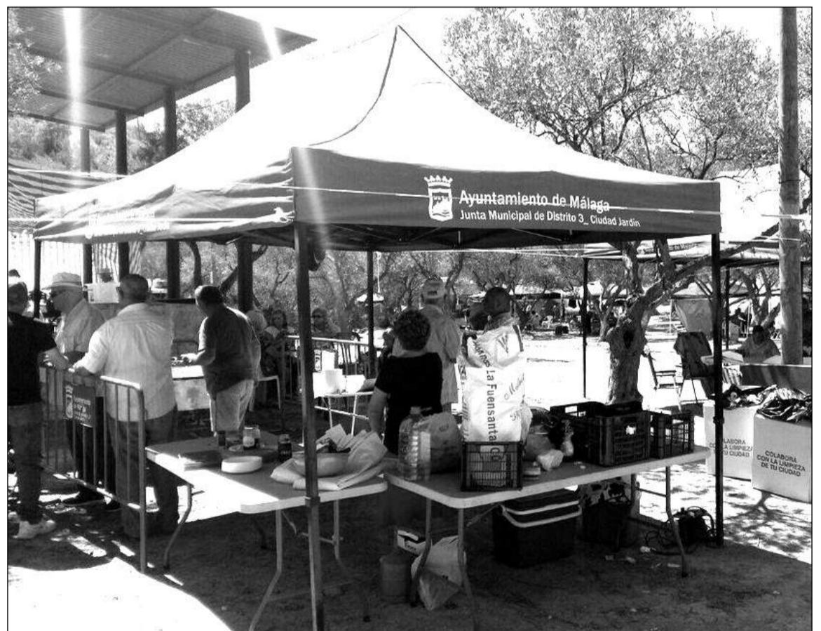
Zona de acampada donde las peñas ofrecieron una paella a los peregrinos.

gratuitos para facilitar el desplazamiento de los socios de la entidad.