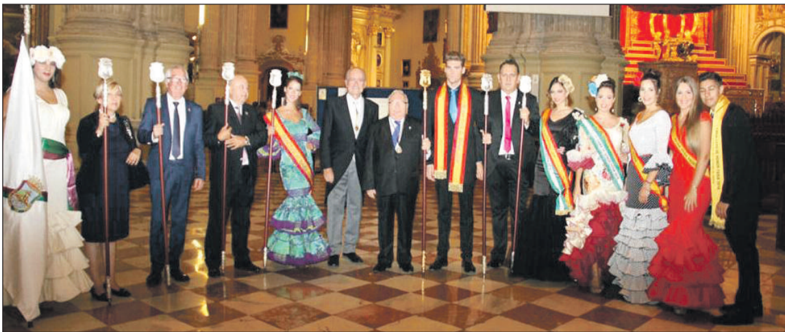
Representación peñista, antes de comenzar la procesión, junto al alcalde de Málaga.