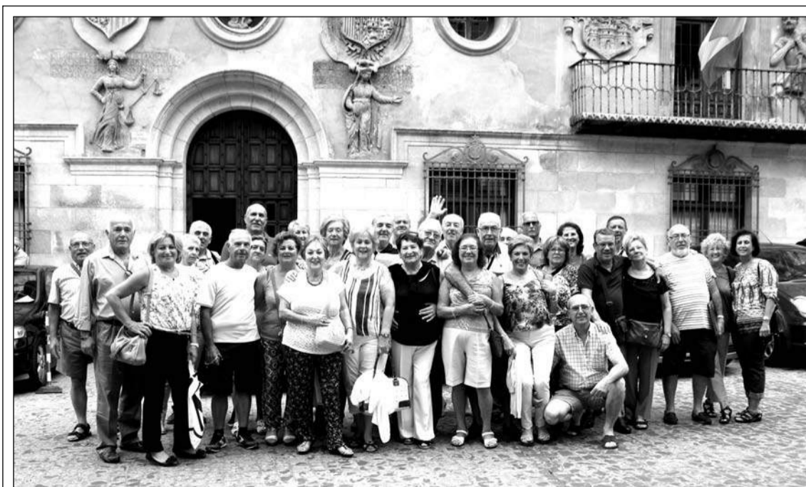
Los socios de la Peña El Seis Doble, entidad perteneciente a la Federación Malagueña de Peñas, Centros Culturales y Casas Regionales 'La Alcazaba' han disfrutado de una excursión a Zaragoza, Monasterio de Piedra y Tarazona, que se ha desarrollado de 7 al 12 de septiembre.