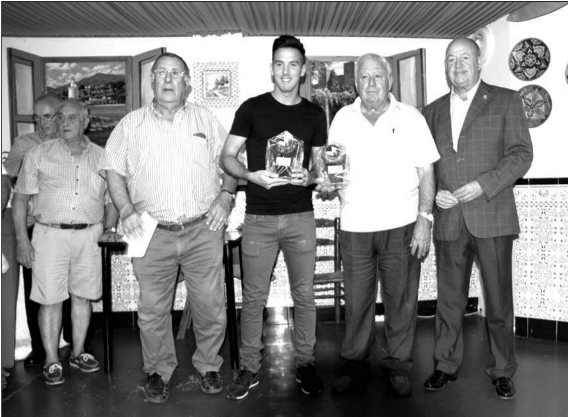
El presidente de la entidad y el relaciones públicas de la Federación, con dos de los premiados.