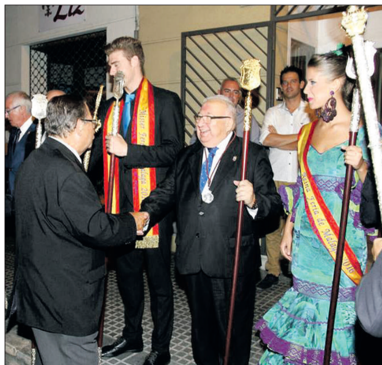
Despedida a los miembros de la hermandad desde la sede de la Federación.