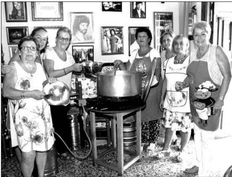
Socias preparando las berzas.