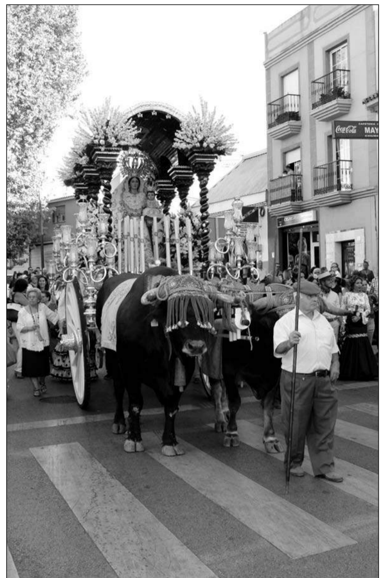
Romería de la Virgen de la Alegría.