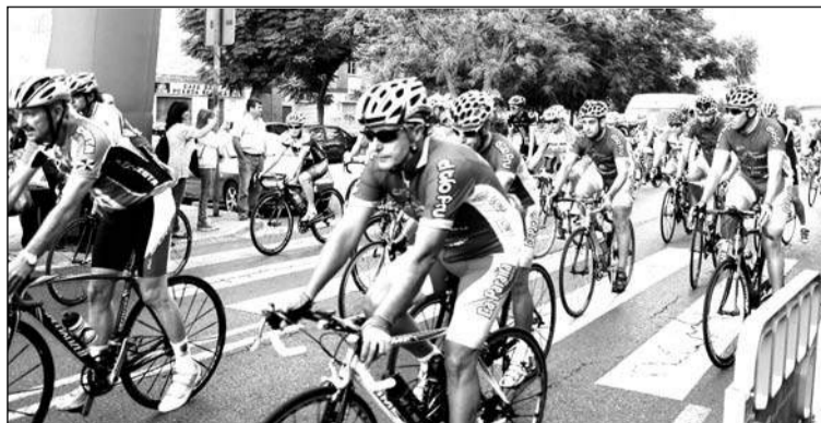
Salida de la Marcha Cicloturista en una edición anterior de la prueba.

Así, está anunciada la presentación del cartel de su Marcha Cicloturista, que tendrá lugar el jueves 22