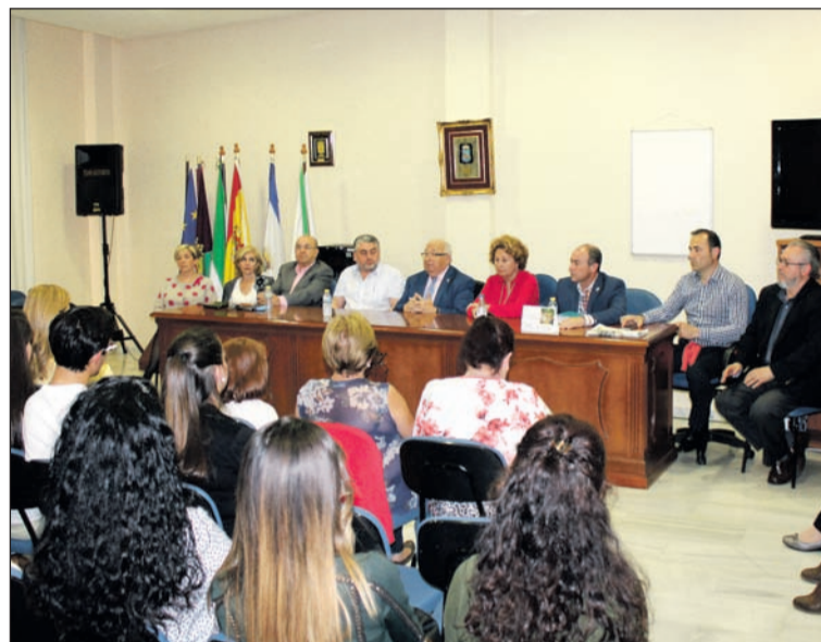
Acto de inauguración de este curso.

diciembre se celebrará una gala de clausura del curso, con un espectáculo especial en el que los alumnos podrán mostrar la evolución que han tenido gracias a las enseñanzas, totalmente gratuitas, que adquieren en esta Escuela de Copla 'Miguel de los Reyes' que impulsa la Federación Malagueña de Peñas, Centros Culturales y Casas Regionales 'La Alcazaba'.