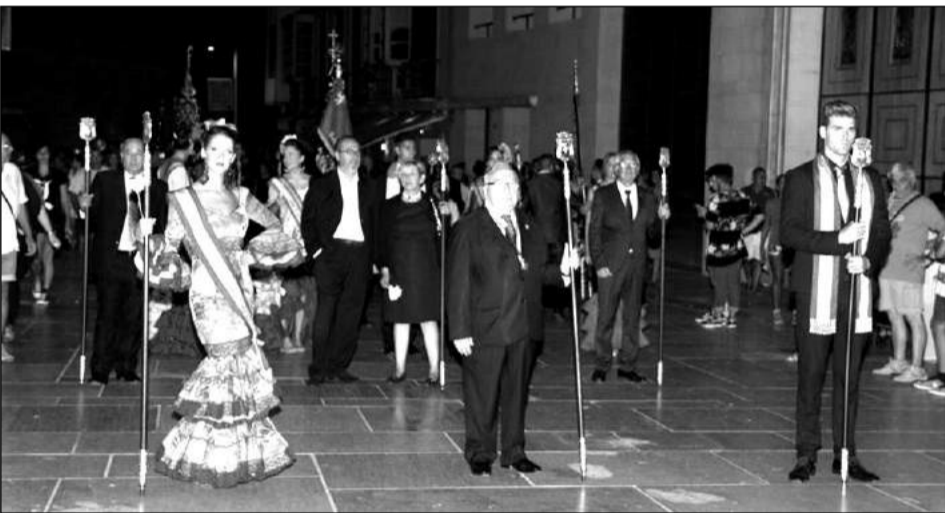
Comitiva peñista por la calle Alcazabilla.