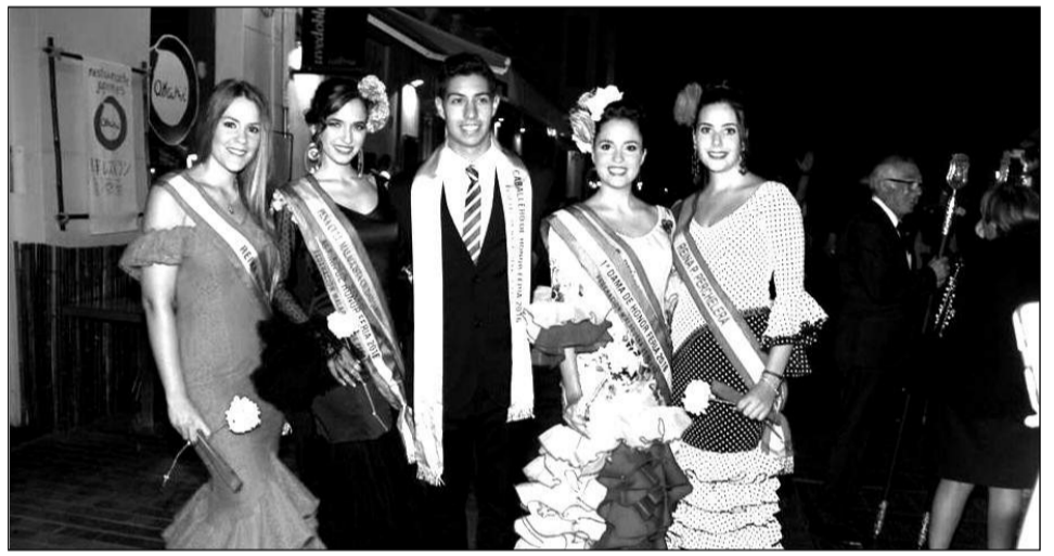
Cuatro Damas de Honor con un Caballero de Honor que participaron en la procesión.