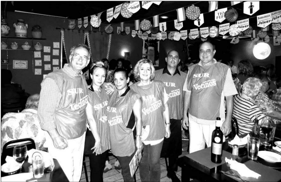
El Diario Sur, con antiguas camisetas del periódico Vecinos, fue recordado con cariño.