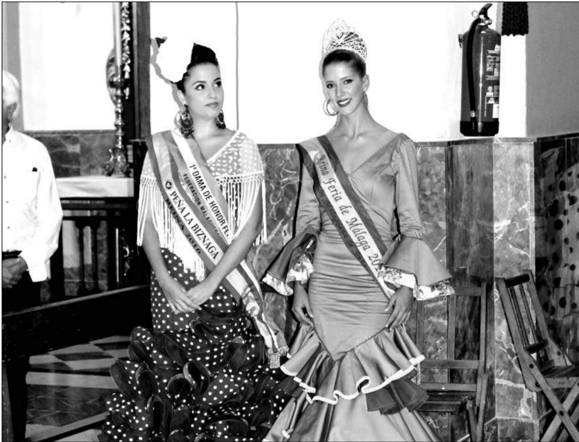
La Reina de la Peña La Biznaga, junto a la Reina de la Feria de Málaga en la iglesia de la Divina Pastora.