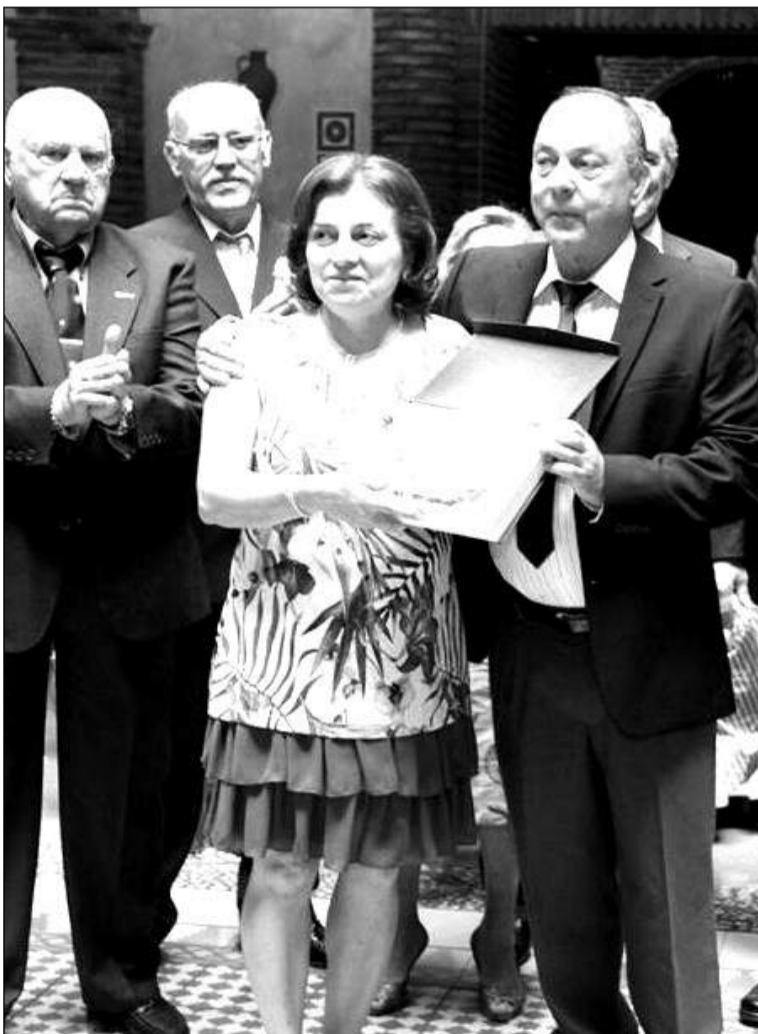
Entrega de una distinción.