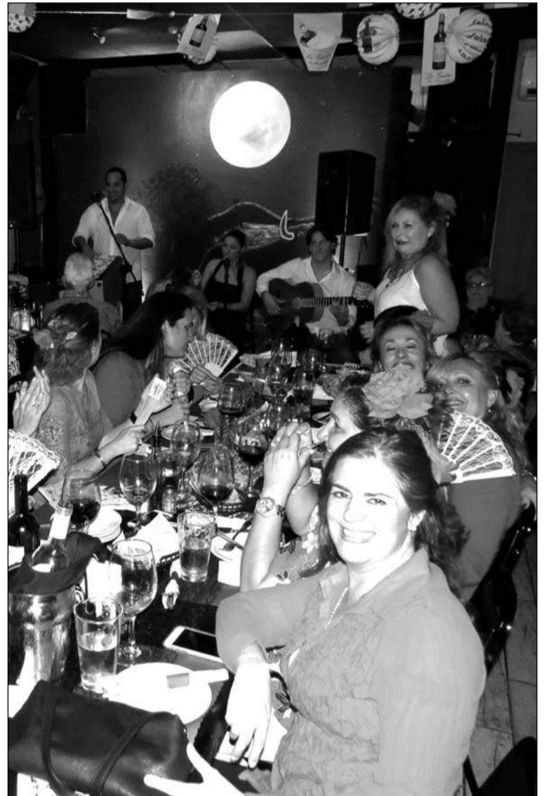
Ambiente de la velada.