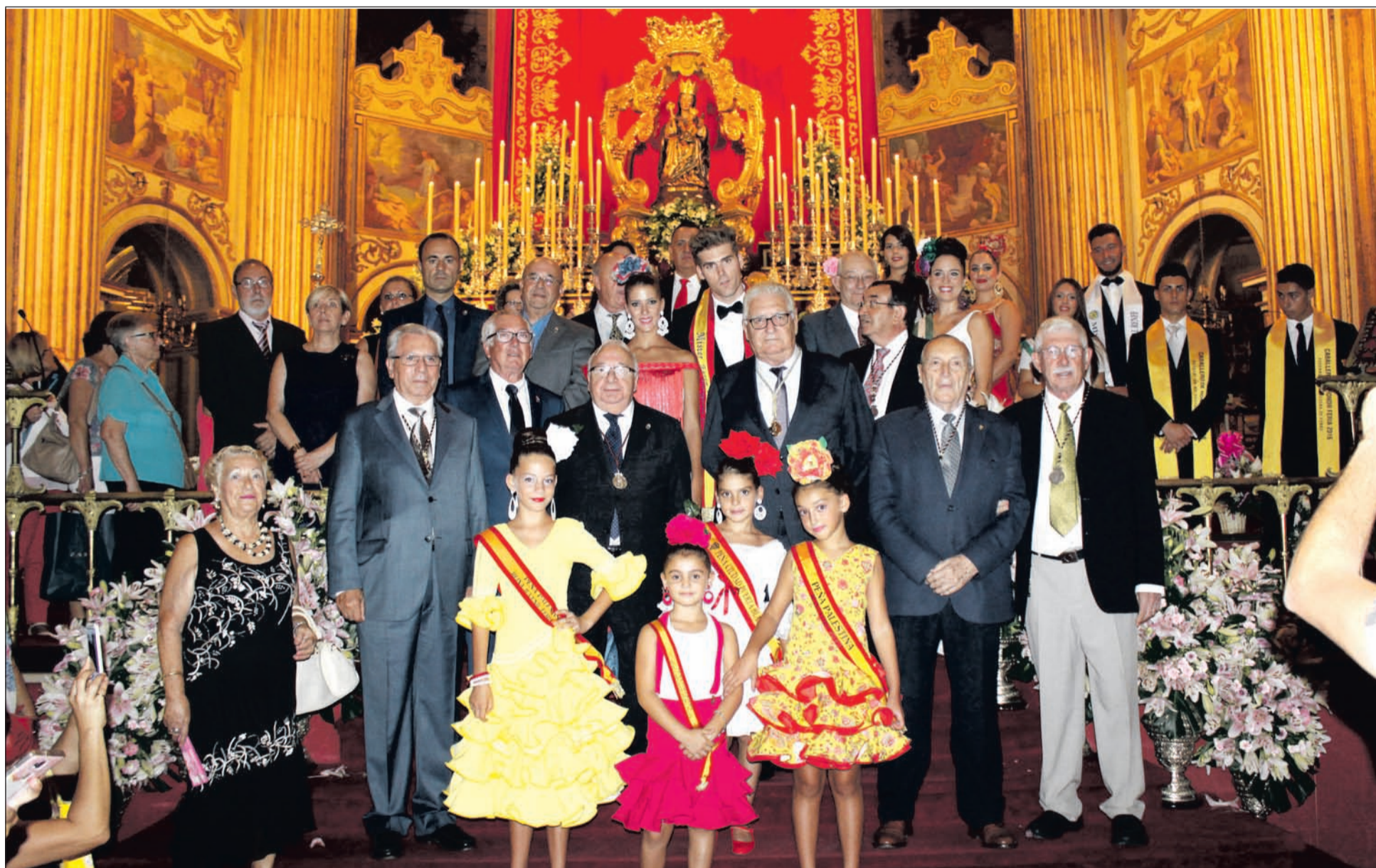
Participantes en la Ofrenda Floral de la Federación de Peñas a Santa María de la Victoria.

Hay cosas que son exclusivamente malagueñas