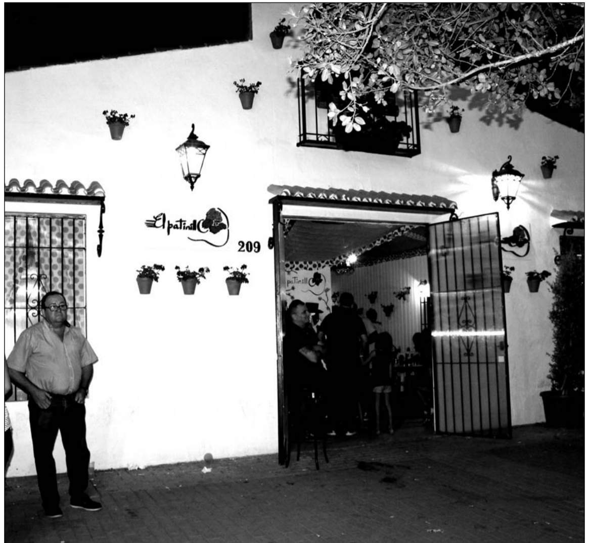
Fachada de la caseta de El Patio (Asociación Cultural Nuevo Flamenco).

Estos premios se conceden gracias al patrocinio de diferentes empresas colaboradoras con este colectivo. De este modo, las relativas a interiores son entregados por Cervezas Victoria, Tesesa y Diario Sur; mientras que las de fachadas corresponden a Cafés Santa Cristina, Coca Cola y Vulcanizados San Martín, respectivamente.