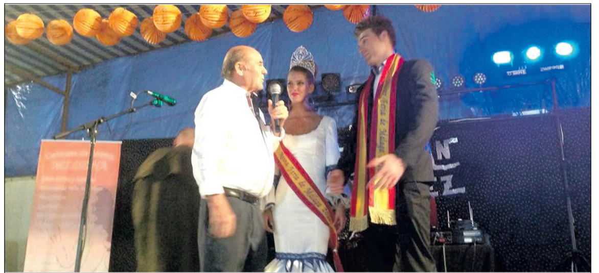
Visita a la caseta de la Peña Ciudad Puerta Blanca, donde fue elegida la reina.