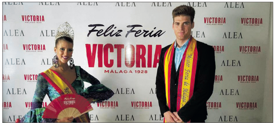
Visita a la caseta de Cerveza Victoria en Alea, donde fueron entrevistados por la cadena Ser.