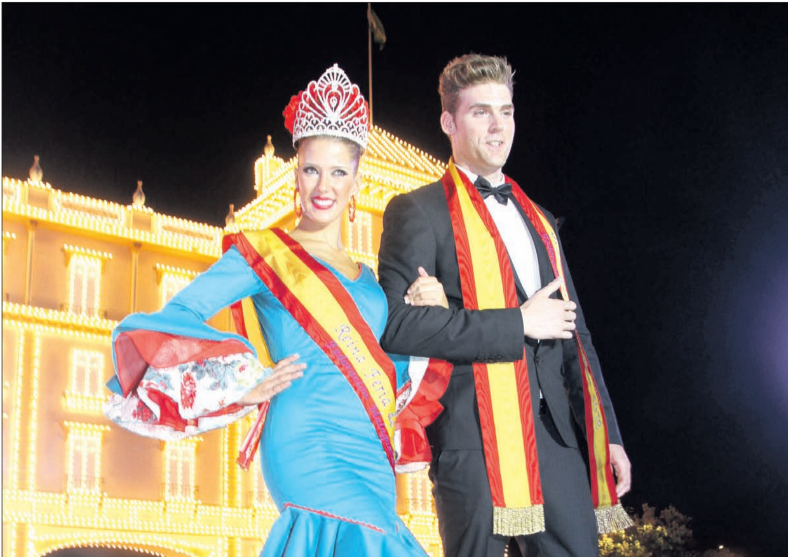
La Reina y el Mister, felices tras ser nombrados en la portada del recinto ferial.