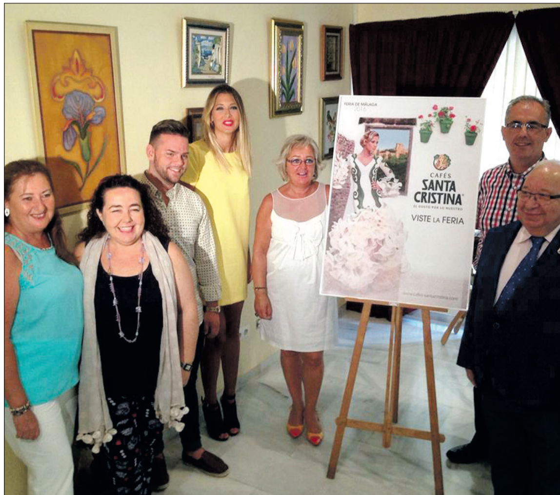
Participantes en la rueda de prensa con algunas de las actuaciones de la caseta.

La apertura e inauguración de la caseta tenía lugar el sábado 13 con visita de autoridades,