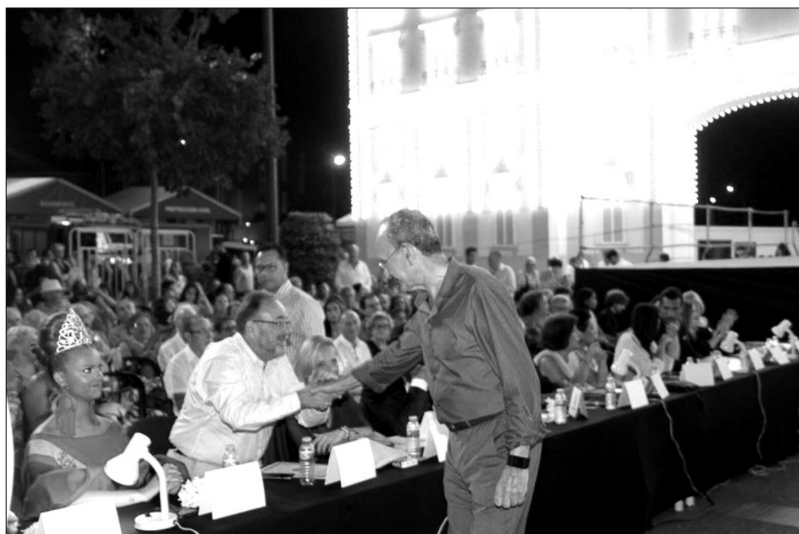
El alcalde saluda al presidente del jurado a su llegada a la gala de elección.