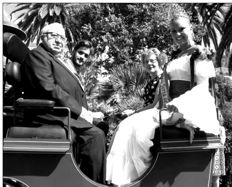
El presidente de la Federación y su esposa, con la Reina y el Mister de 2015.