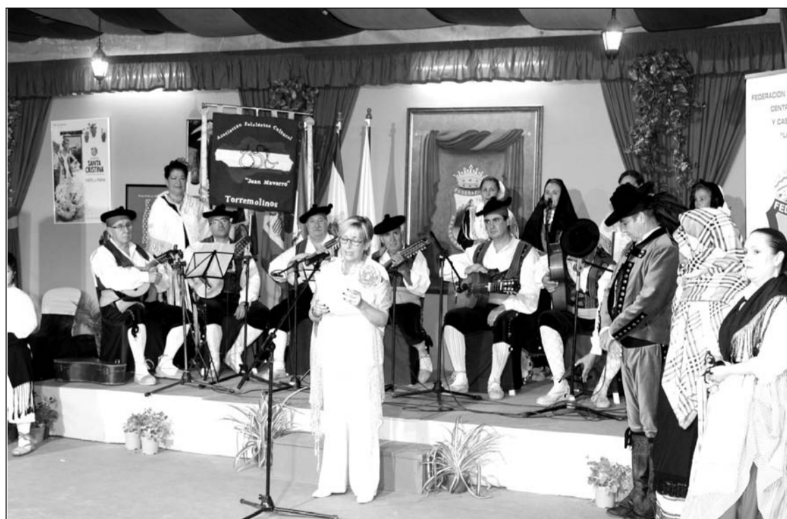
Presentación de la Asociación Cultural Juan Navarro de Torremolinos.