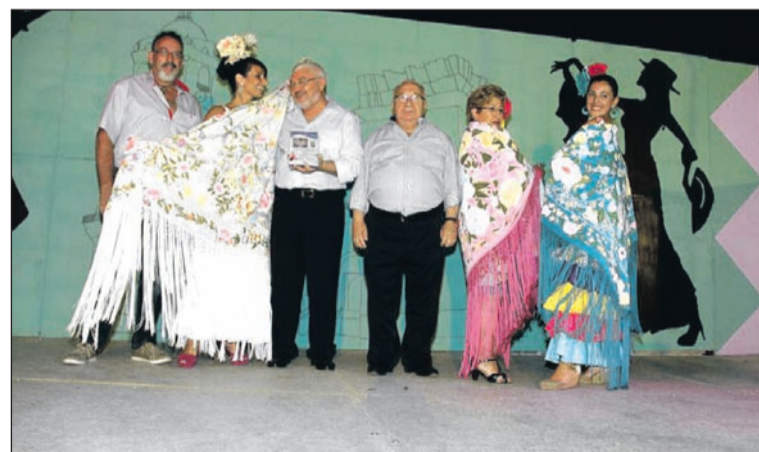
Ganadoras en la modalidad de mantones pintados.