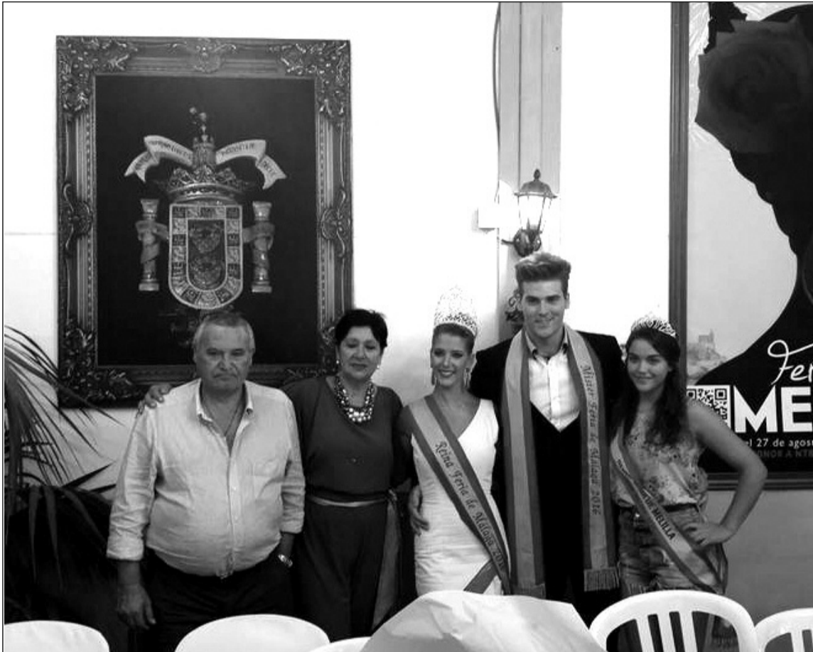
La Reina y el Mister visitan la caseta de la Casa de Melilla, con el presidente y su esposa y la reina de la entidad.