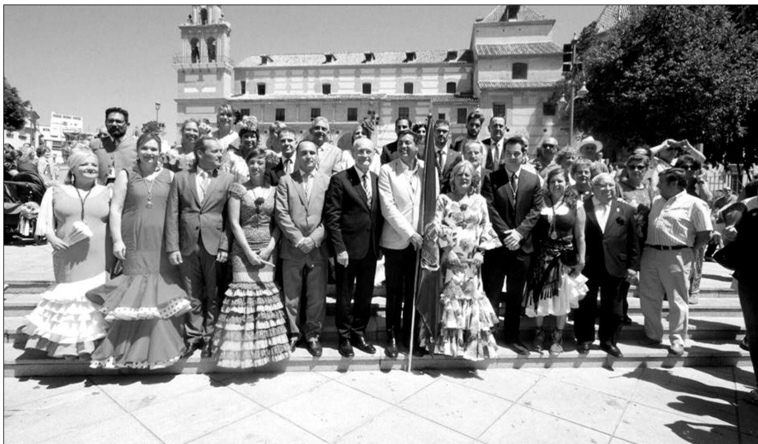
La comitiva, a su llegada al Santuario.