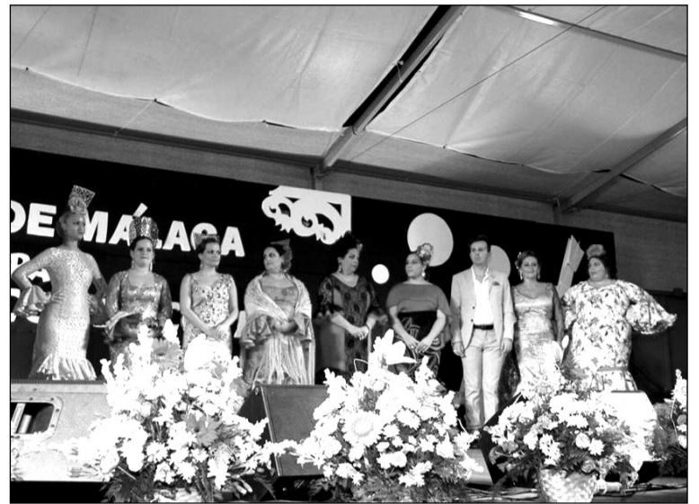
Finalistas de este certamen.

Numeroso público siguió con gran atención este gran espectáculo musical que por segunda vez se celebraba en la Feria de Málaga.