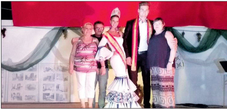
Visita a la caseta de El Parral, a la que representaba el Mister.