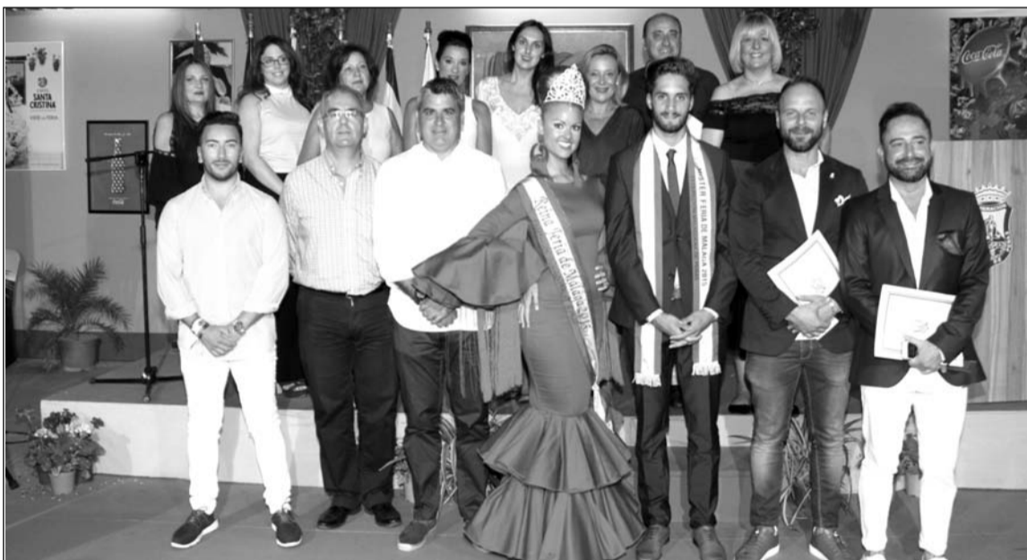
Algunos de los componentes del jurado, entre ellos los vencedores del certamen del pasado año.