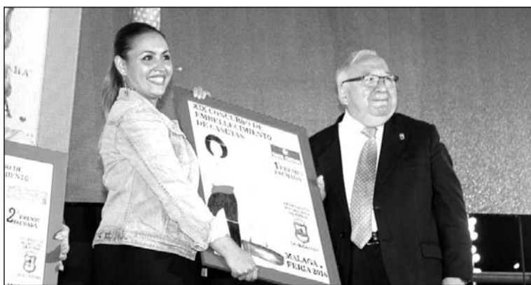
Entrega del premio de fachadas.