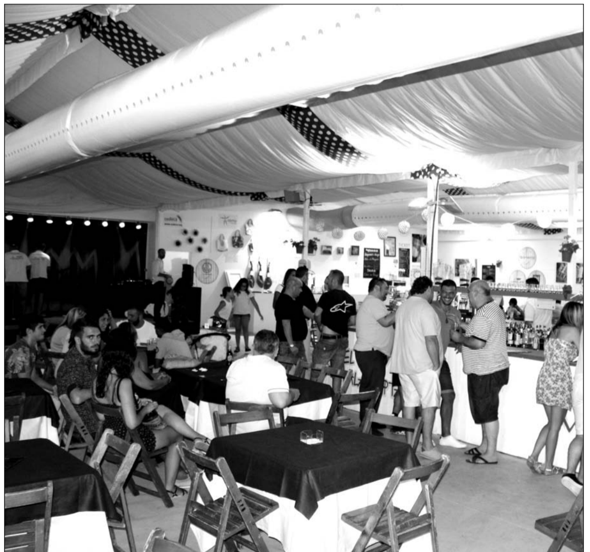
Interior de la caseta El Malaguista, de la Asociación Cultural Litoral.