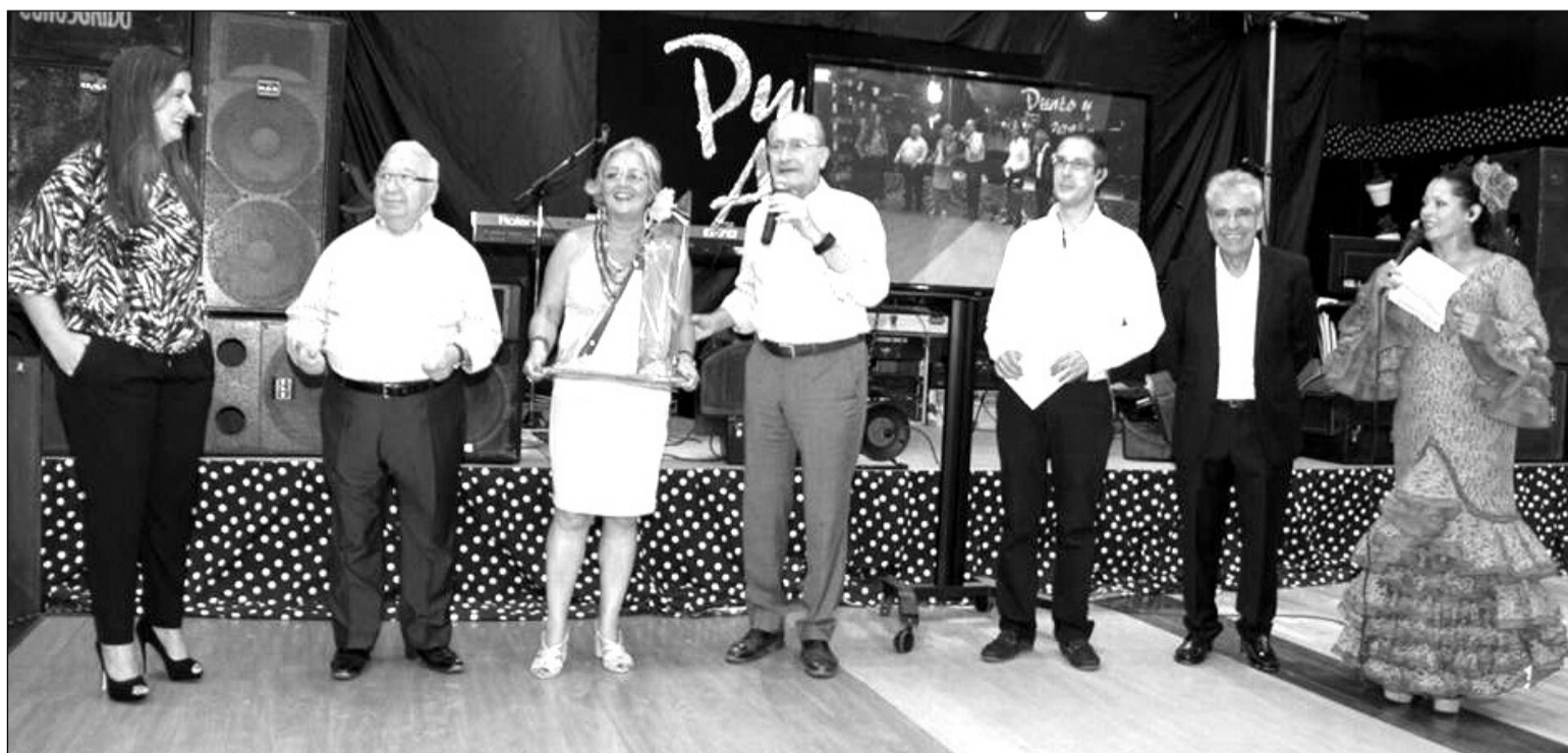
Intervención del alcalde en el transcurso de la gala organizada por PTV.