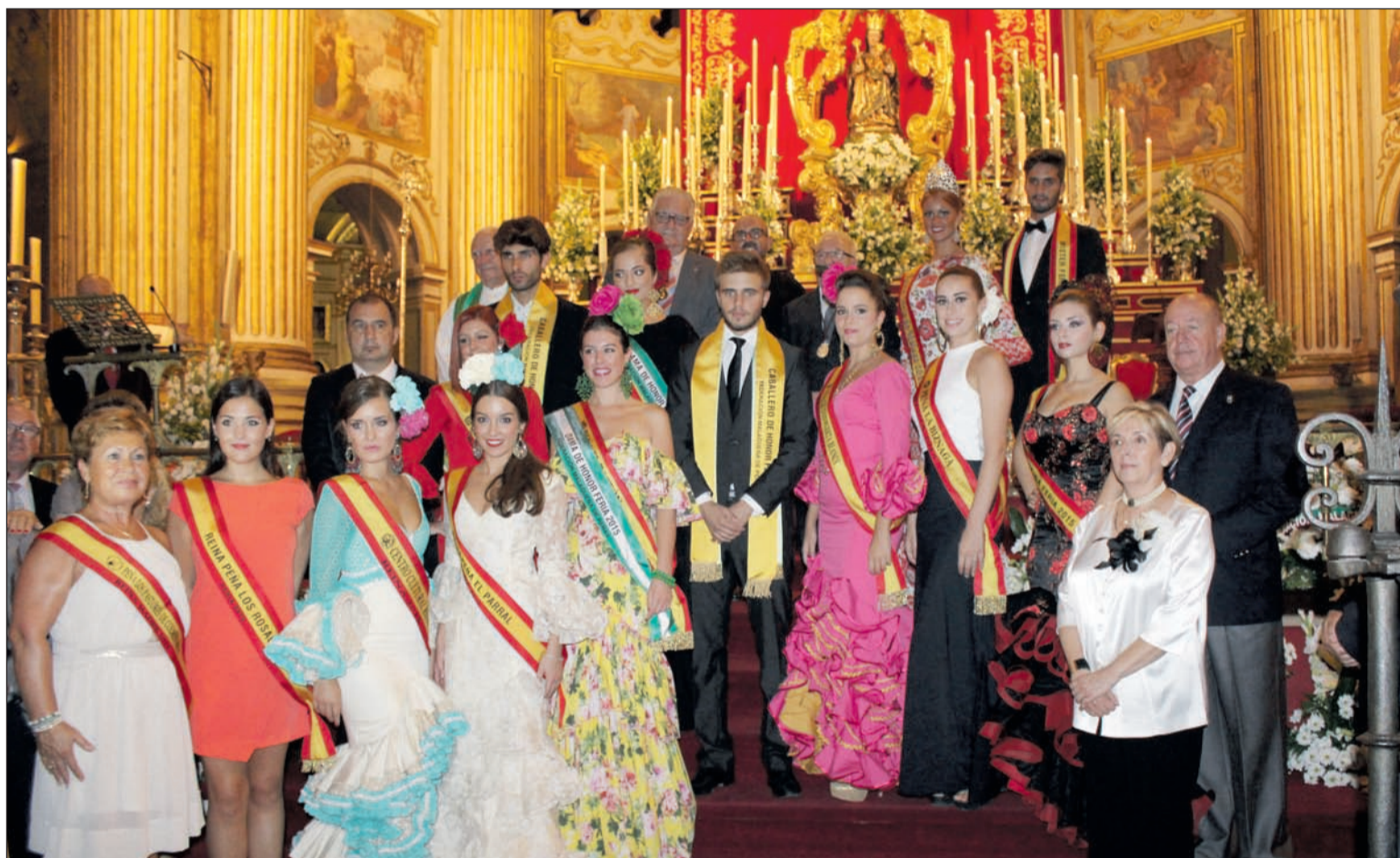
Ofrenda floral del pasado año a Santa María de la Victoria en la Santa Iglesia Catedral.

de la belleza malagueña se recontrarán con la patrona en su día grande al participar en la Solemne Procesión de Santa María de la Victoria en su onomástica. En este caso será la Reina y el Mister, con sus cinco Damas y Caballeros de Honor, los que participen en este cortejo acompañando a componentes de la junta directiva de la Federación.