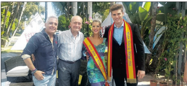
En 101 TV coincidieron con el alcalde.