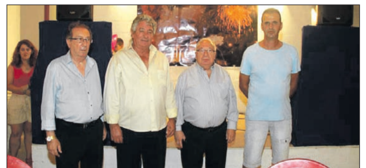
La hermandad entre la Federación Malagueña de Peñas y la Asociación de Feriantes de Málaga se ratificaba el pasado lunes con la visita del presidente de los peñistas a la caseta de esta entidad.