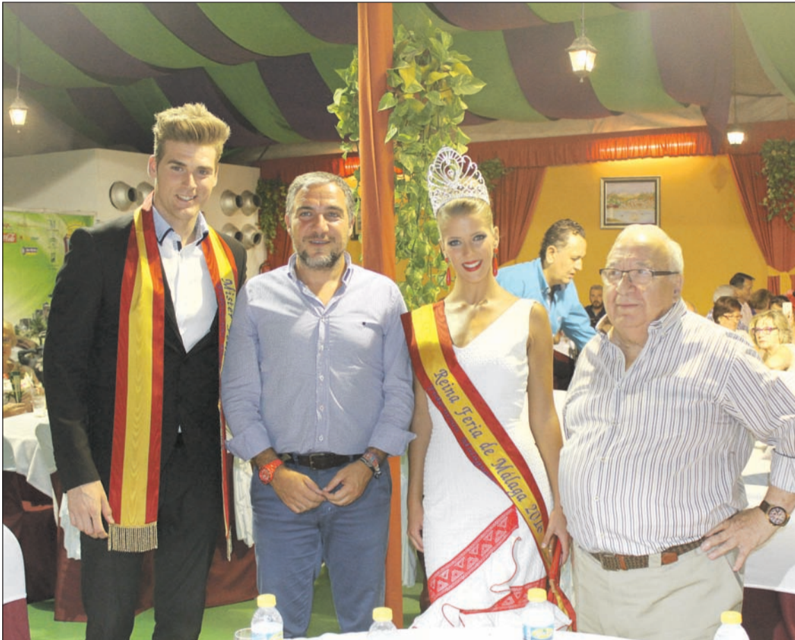
El presidente de la Diputación, Elías Bendodo, con la reina y el mister de la Feria y el presidente de la Federación.