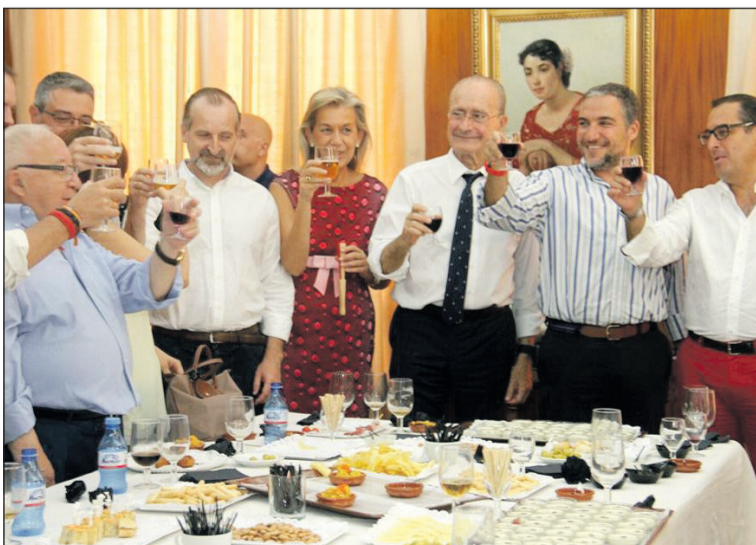
Recepción en Diputación, con el alcalde, el presidente y el Subdelegado.

de Málaga, Elías Bendodo, entre otros. Este último asistía el sábado 20, recibiendo un obsequio de parte del presidente. Además, previamente, el miércoles 18, se había realizado una