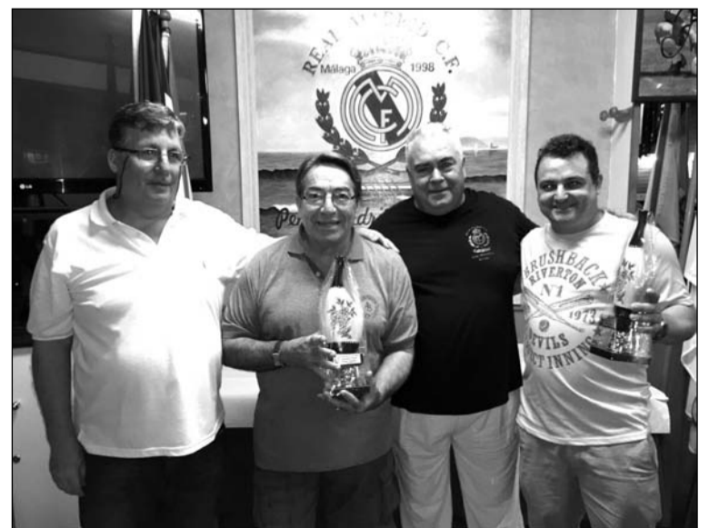
Entrega del premio a los primeros clasificados.

El acto de entrega de trofeos a los ganadores, por su parte, se celebraba la jornada del jueves 11 de agosto, a partir de las 20:30 horas, en la sede de esta entidad perteneciente a la Federación Malagueña de Peñas, Centros Culturales y Casas Regionales 'La Alcazaba'.