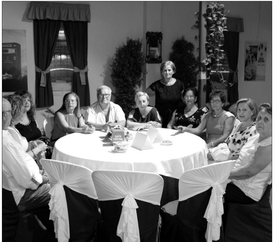
Grupo de socios de la asociación que se desplazaron hasta nuestra capital para recoger el premio.