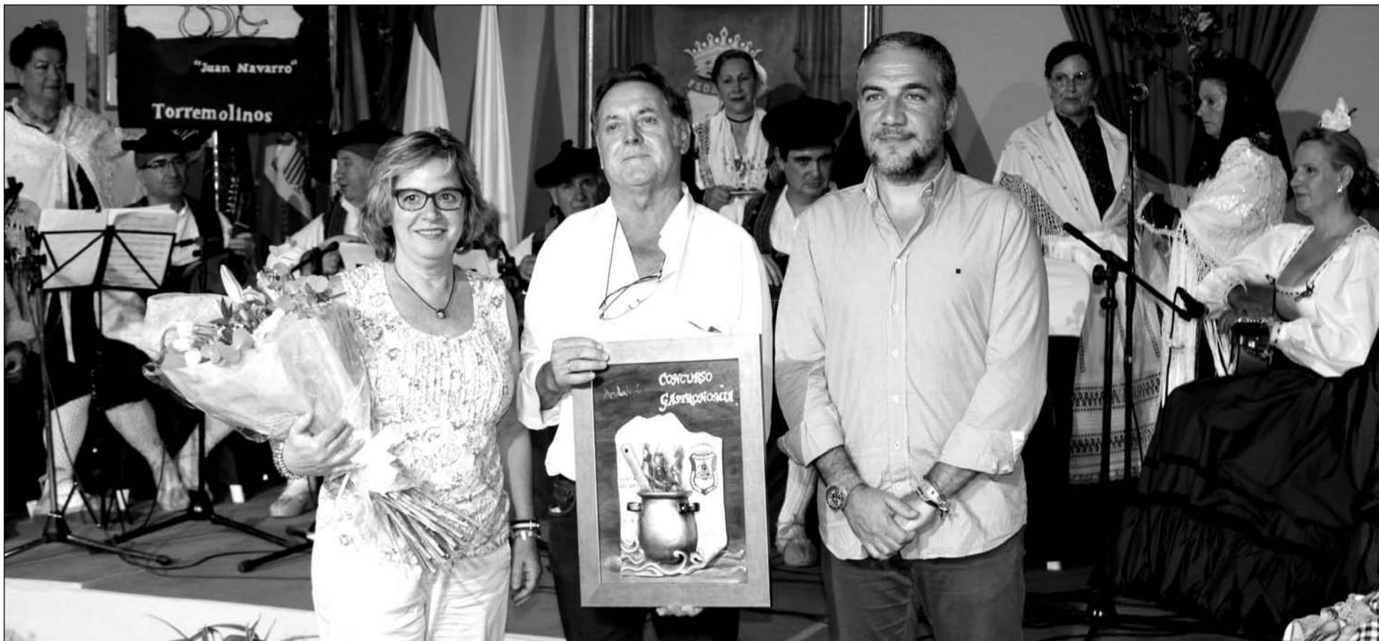
Acto de entrega del Premio a la Mejor Gastronomía de la Feria de Málaga 2016.