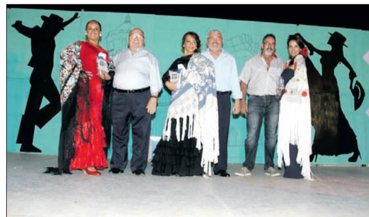
Tres primeras clasificadas en la categoría de mantones bordados.