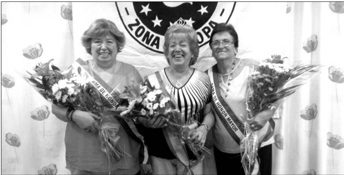
La Reina Mayor con sus Damas de Honor.