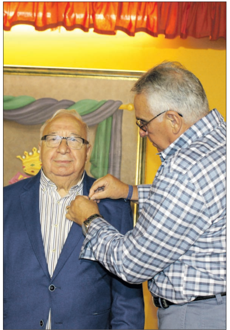
Instante de la imposición del Escudo de Oro.