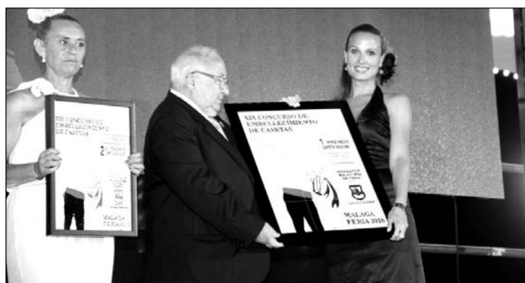
Entrega del premio de interiores.