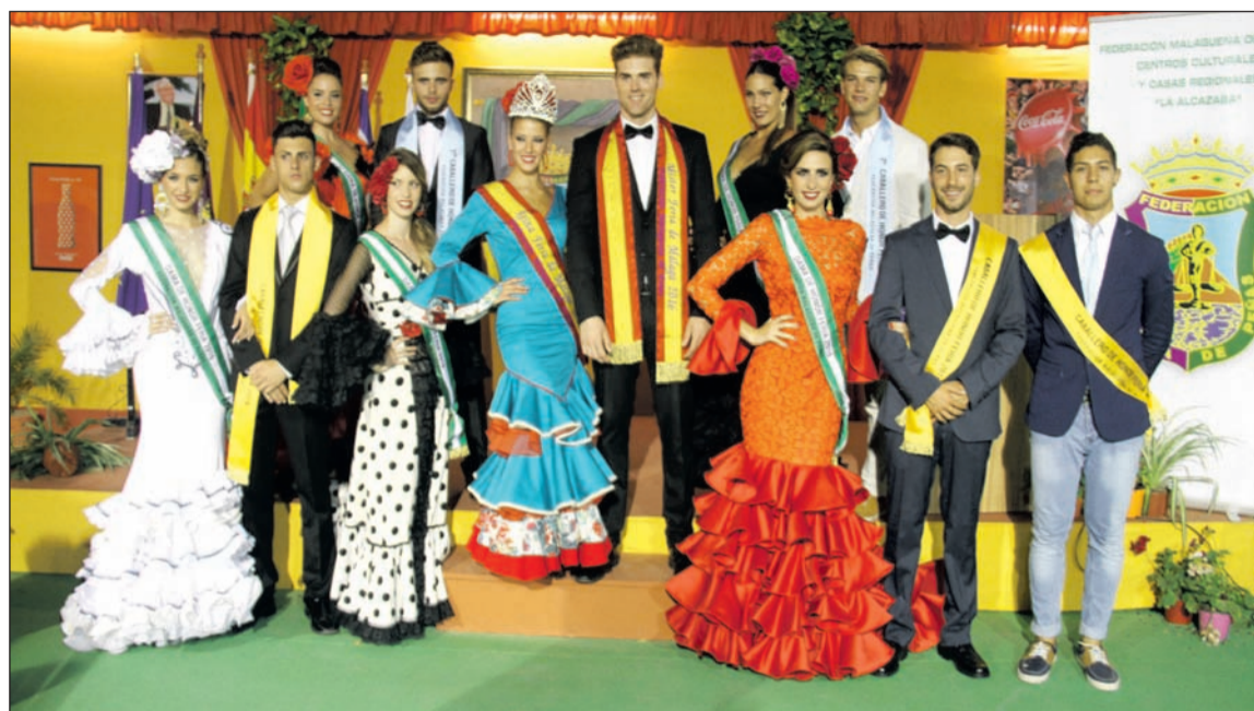
La Reina y el Mister con sus Damas y Caballeros de Honor, en la recepción celebrada en la caseta de La Alcazaba.