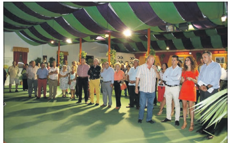
Asistentes al acto de inauguración.