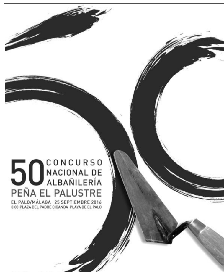
Detalle del cartel del Concurso Nacional de Albañilería.

El 19 de septiembre, a las 20:30 horas será la inauguración de una escultura conmemorativa de los Concursos de Albañilería en la Plaza del Padre Ciganda, frente al colegio Safa-Icet, donde el 25 de septiembre, a las 8 de la mañana, comenzará el 50 Concurso Nacional de Albañilería.