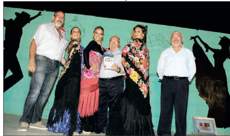
Premios al mejor lucimiento del mantón de manila.