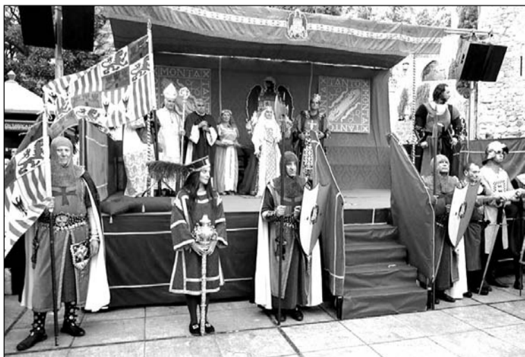
Acto de entrega de llaves en la puerta de la Alcazaba.

agosto una recreación de la entrada de los Reyes Católicos en nuestra ciudad, con una cabalgata que fue seguida por miles de personas desde su salida de la Alcazaba, donde se simbolizaba la entrega de llaves de Málaga.