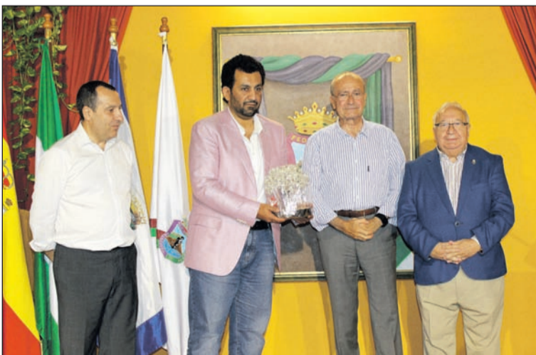
El jeque Al Thani, con el obsequio personal que se le entregó.

Diseño y Fabricación de Puertas, Armarios y Parquet