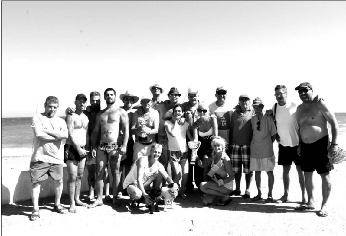
Socios que participaron en el concurso de pesca.

neciente a la Federación Malagueña de Peñas, Centros Culturales y Casas Regionales 'La Alcazaba' se hacía entrega de los trofeos a los ganadores.