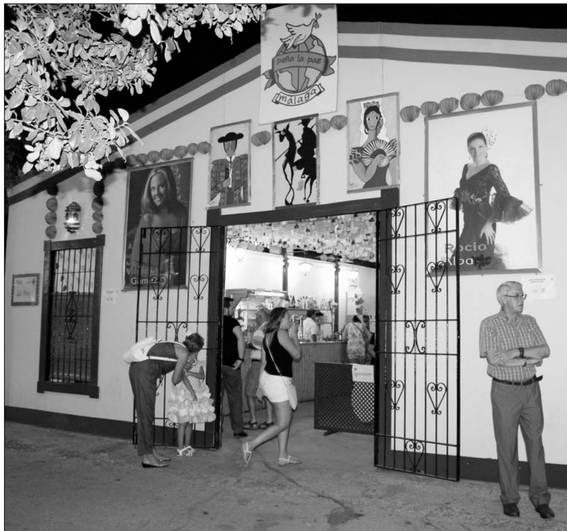
Fachada de la caseta de la Peña La Paz, ganadora del certamen de 2015.

Estos premios se conceden gracias al patrocinio de diferen-