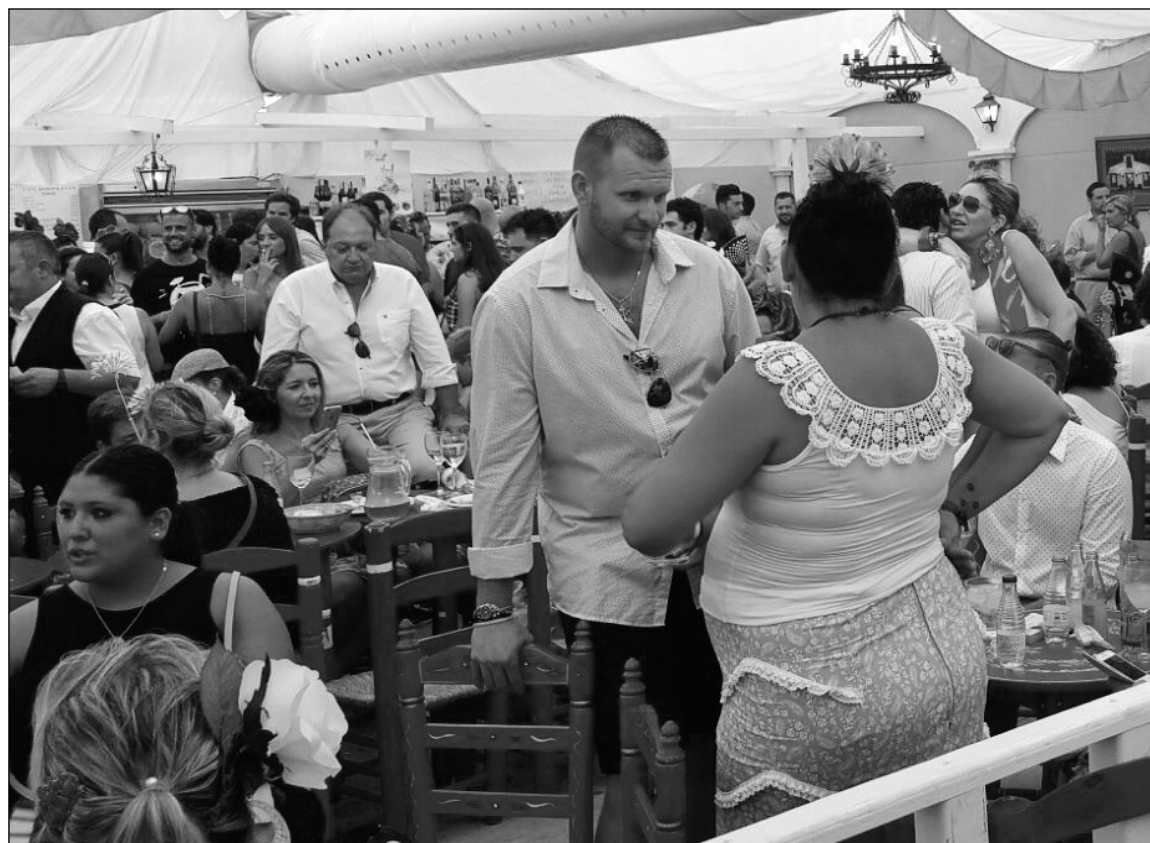
Interior de la caseta de Amigos de Los Mimbrales el pasado año.