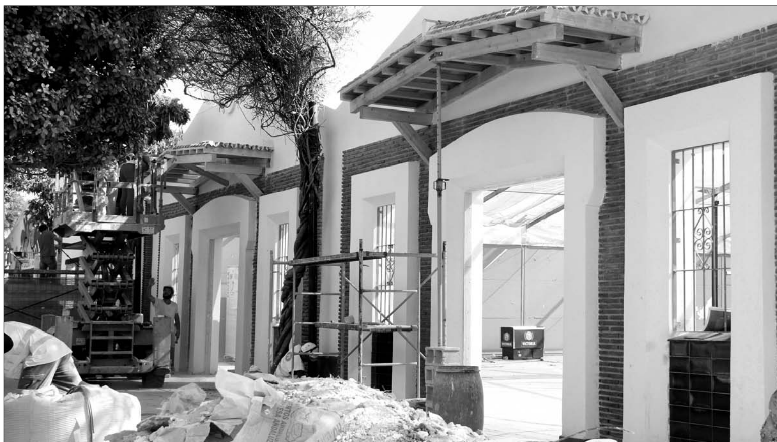
Estado final de los trabajos de construcción de la primera fase de la caseta de la Federación Malagueña de Peñas.

Igualmente, desde el colectivo se asegura que se seguirá trabajando para que finalmente sea una realidad, como las entidades reclaman, por el bien de nuestra ciudad y del disfrute de todos los malagueños y visitantes.