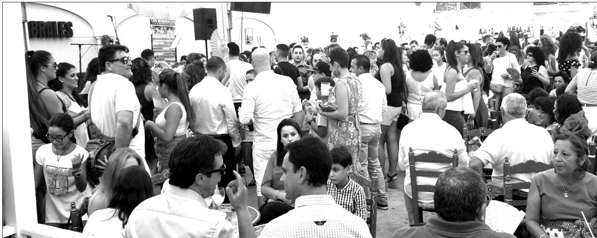
Ambiente en la caseta de la Peña Los Mimbrales, primer premio en la Feria de 2015.

◆ Federación Malagueña de Peñas, Centros Culturales y Casas Regionales 'La Alcazaba'