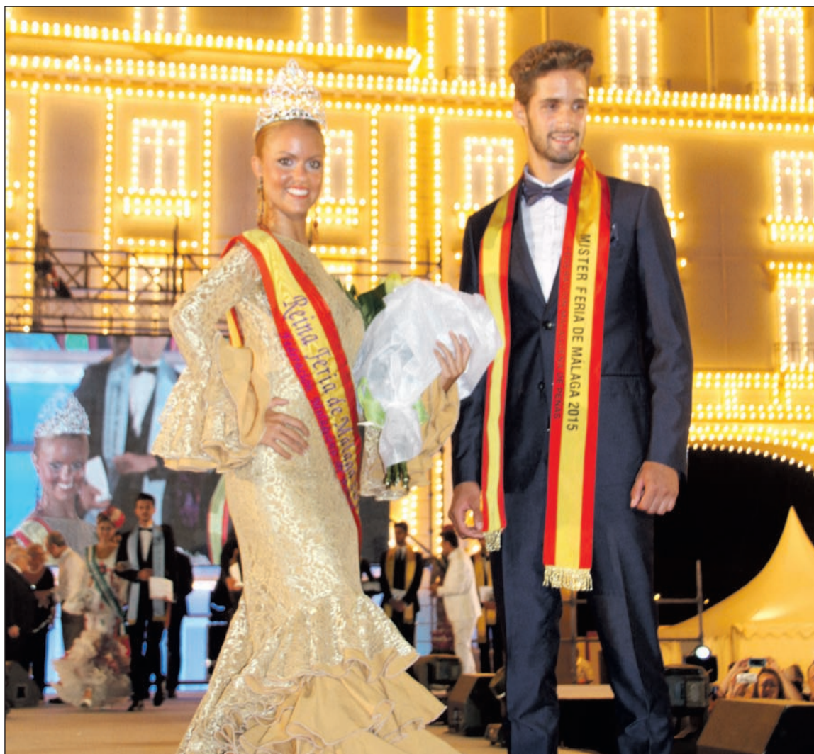
La Reina y el Mister de la Feria del pasado año.