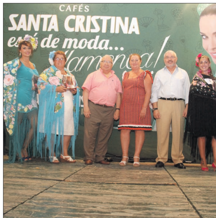
El concurso se celebró en 2015 en la caseta de la Peña Santa Cristina.