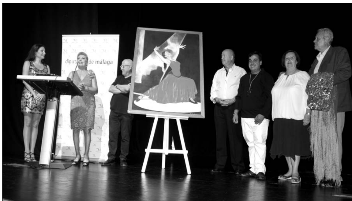
Descubrimiento del cartel de esta edición del festival.

No será el único acto que se celebre durante la feria en la caseta de esta entidad, ya que también habrá tiempo para la solidaridad el lunes 15 de agosto con una fiesta solidaria que se desarrollará de 18 a 21 horas a beneficio de la Fundación Vicente Ferrer, con el objetivo de contribuir a la construcción de un embalse en La India.