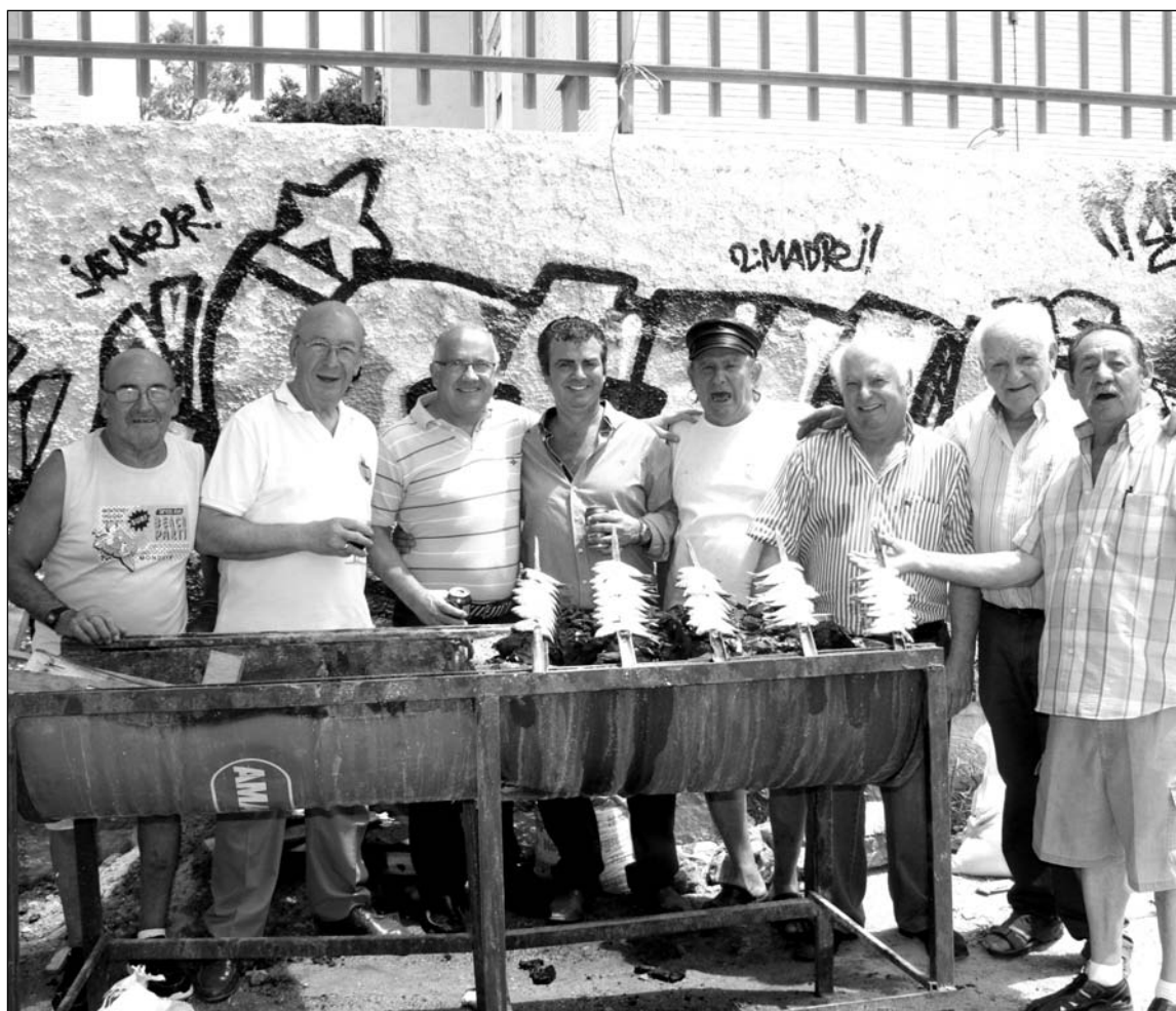
Peñistas malagueños y cordobeses junto a los espetos.

Desde esta entidad perteneciente a la Federación Malagueña de Peñas, Centros Culturales y Casas Regionales 'La Alcazaba' se mantiene una gran relación con esta peña cordobesa, al igual que otras como la Peña El Boquerón, cuya presidenta estuvo presente en este acto y con la que, por error, en el pasado número se indicaba que se había producido este acto de hermanamiento.