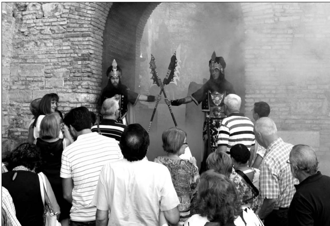
Acceso al recinto de La Alcazaba de Málaga.

En gran medida, junto a las explicaciones e introducciones históricas de los voluntarios, el atractivo de estas visitas reside en la ambientación con que se viste la Alcazaba para recibir a los malagueños: música, danza, exhibiciones de lucha, guerreros surgidos de otros tiempos, poesía y otros elementos que permiten a los visitantes volver atrás en el tiempo, hasta la época musulmana.