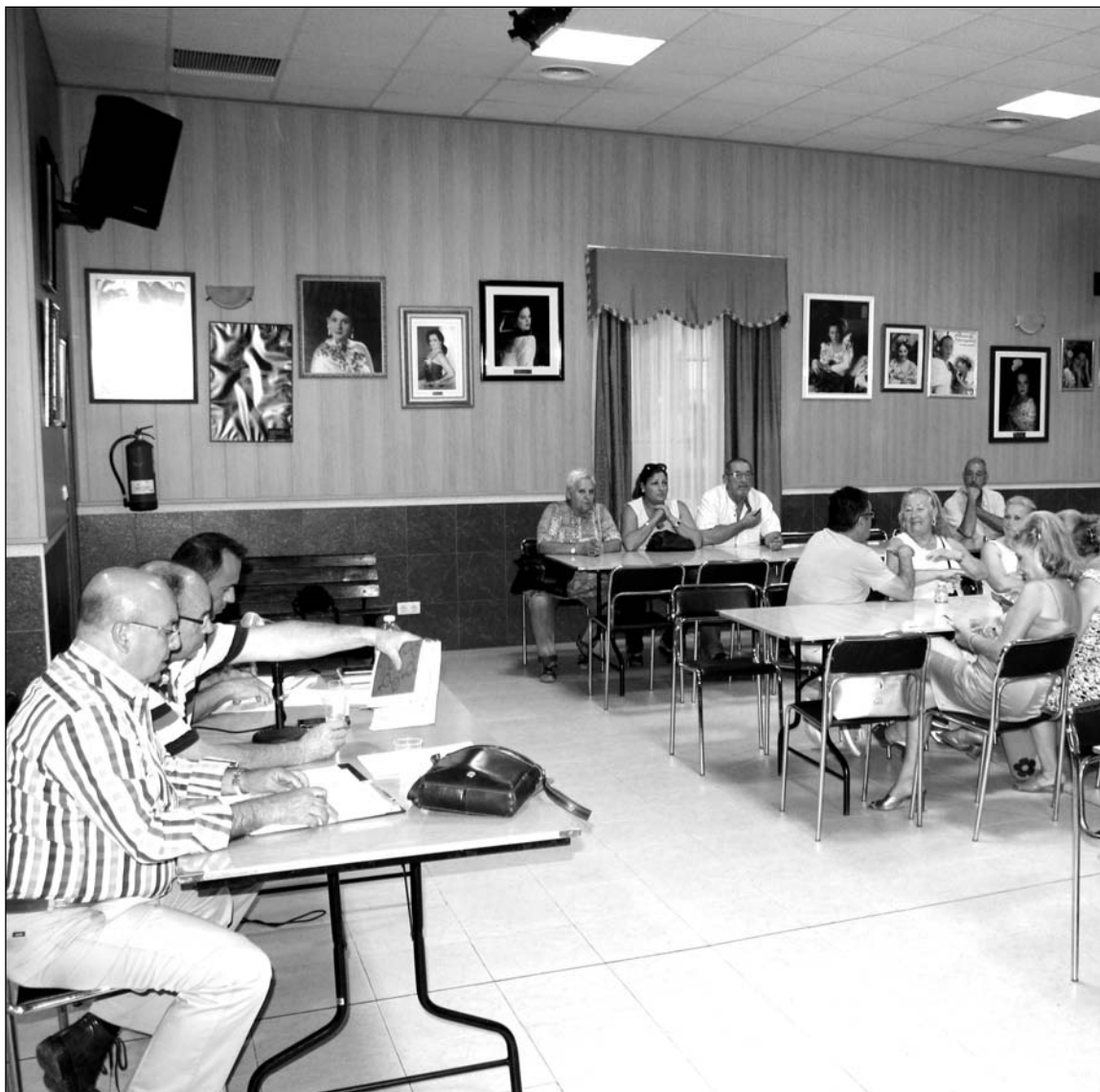
Un instante de la reunión mantenida en la Casa de Álora Gibralfaro.