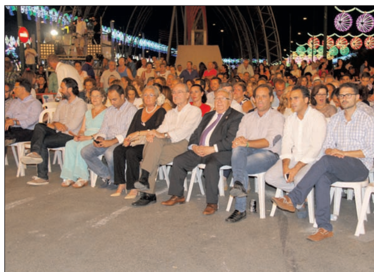
Autoridades presenciando la gala del pasado año.