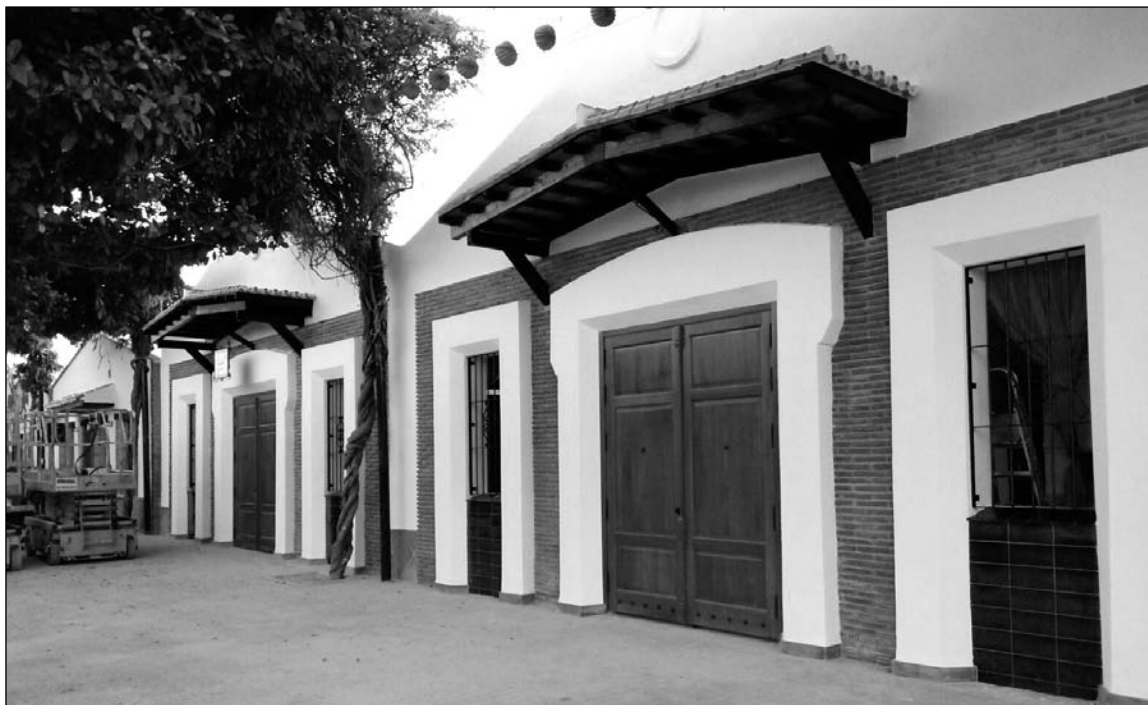
Aspecto final de la fachada de la caseta de la Federación.