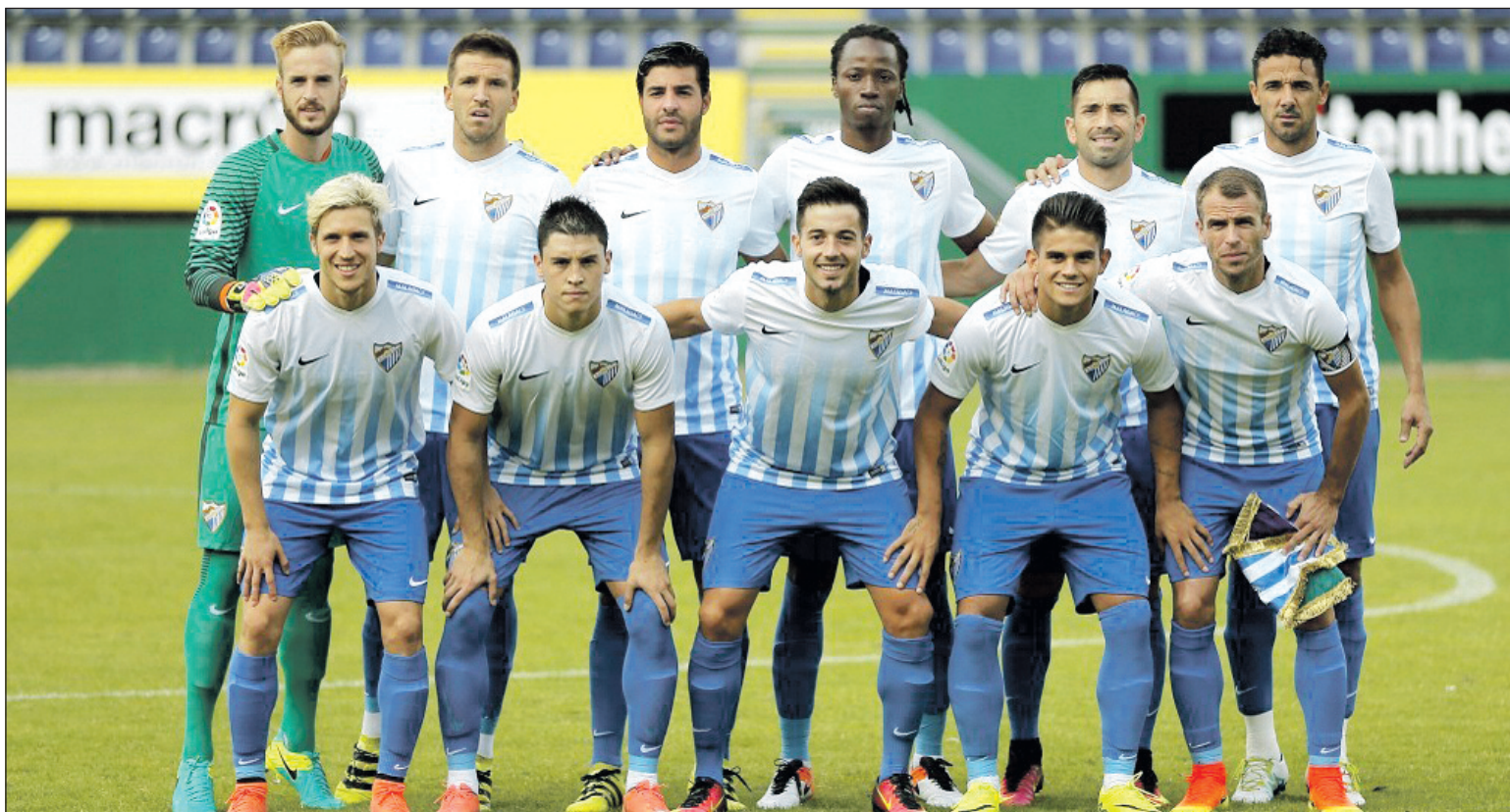
Formación del Málaga Club de Fútbol en uno de los partidos de la presente pretemporada.