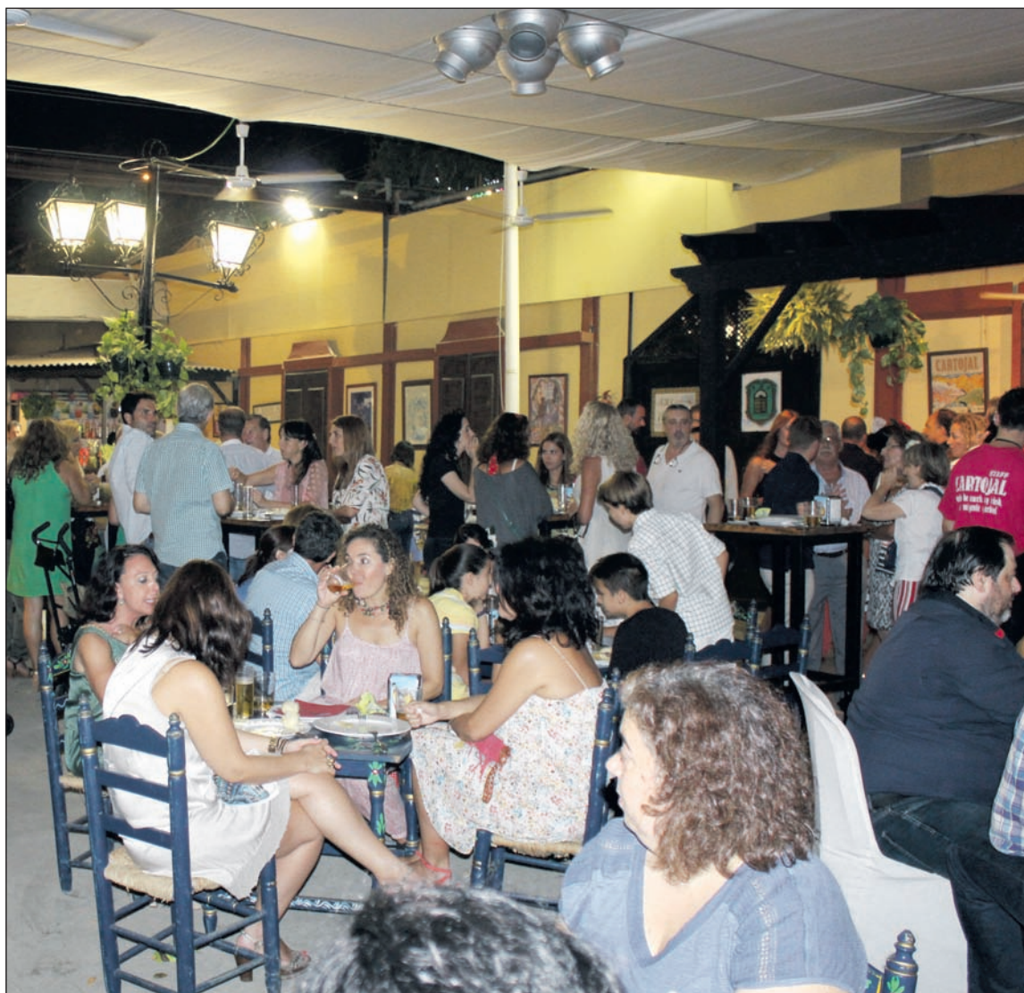
Interior de la caseta de El Portón durante la pasada feria.

La gastronomía es un pilar fundamental de la oferta que cada año ofrece la Feria de Málaga a todos los turistas que visitan la Costa del Sol, ofreciendo la mejor cocina tradicional en un entorno en el que prima la música popular y el ambiente festivo, donde las degustaciones se entremezclan con las actuaciones de coros y grupos de baile.