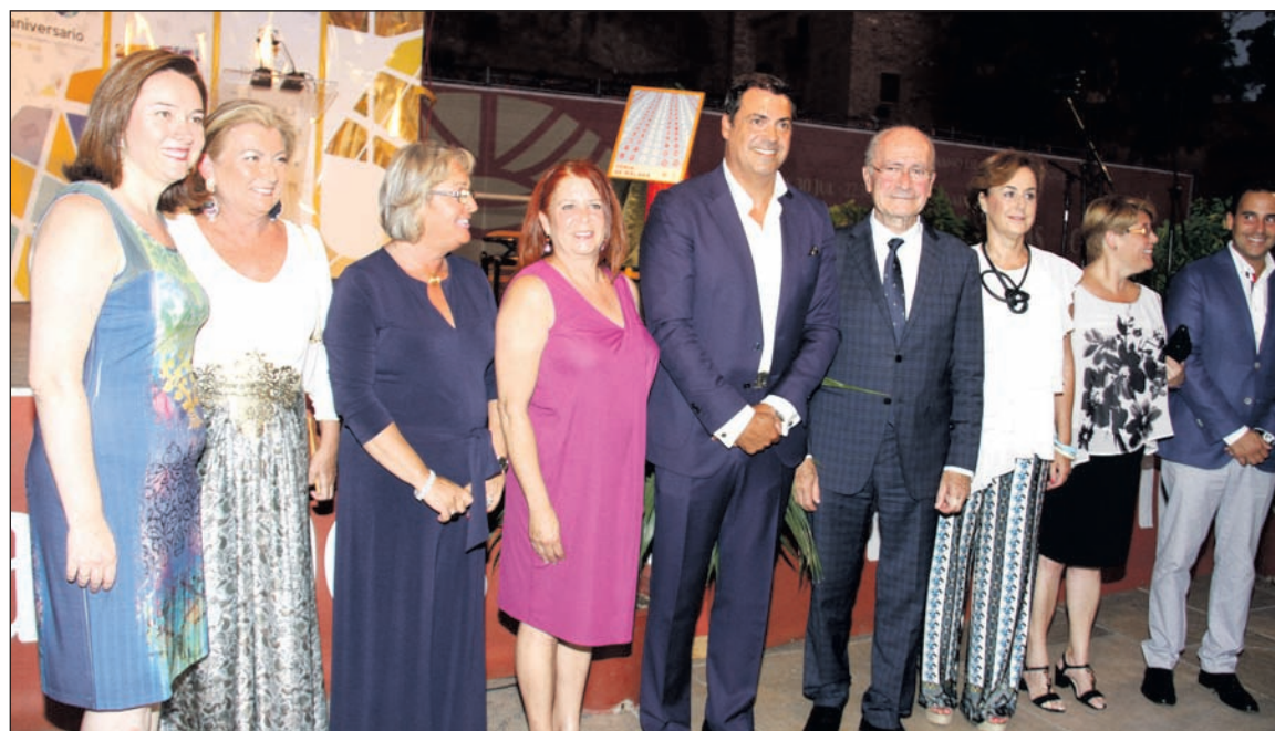
Acto de nombramiento del abanderado de la Feria en calle Alcazabilla.

Entidades colaboradoras con esta publicación: