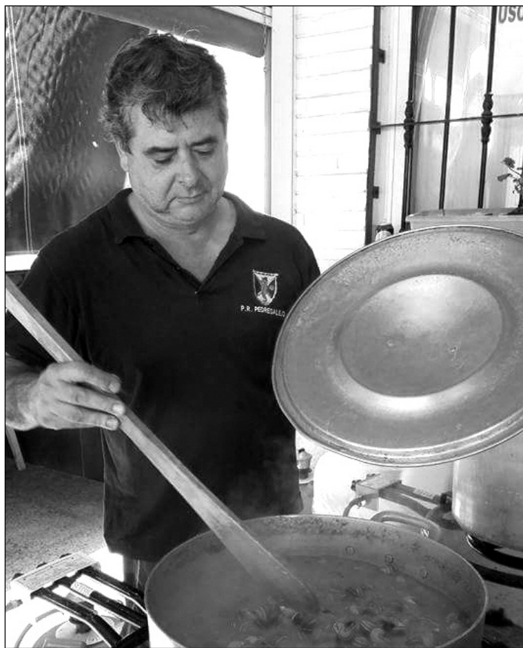
Preparativos de los caracoles en el exterior de la sede.

La actividad mucha aceptación y contó con una gran presencia de socios.