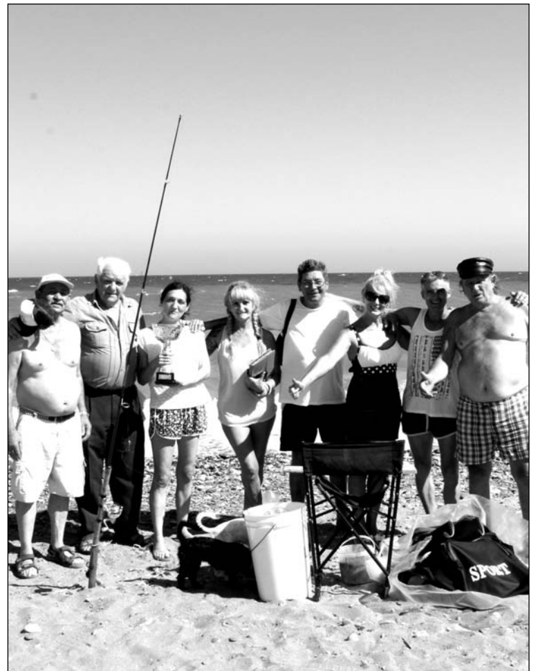
Participantes junto a las cañas de pescar.