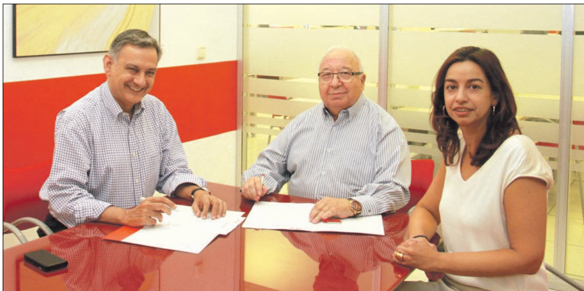
Instante de la firma del convenio entre la Federación de Peñas y Diario SUR.