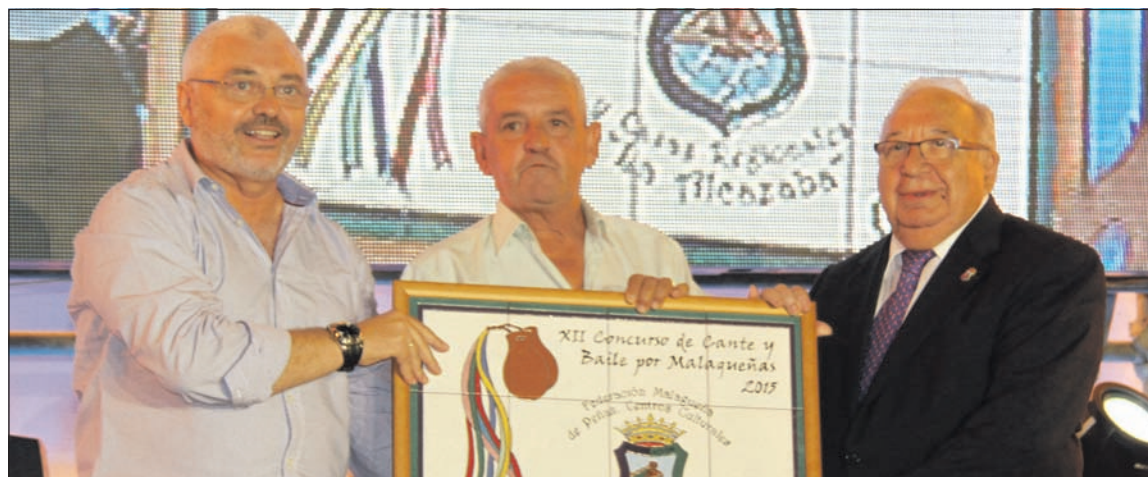
Entrega del premio 'Por Malagueñas' del pasado año a la Peña Los Corazones.