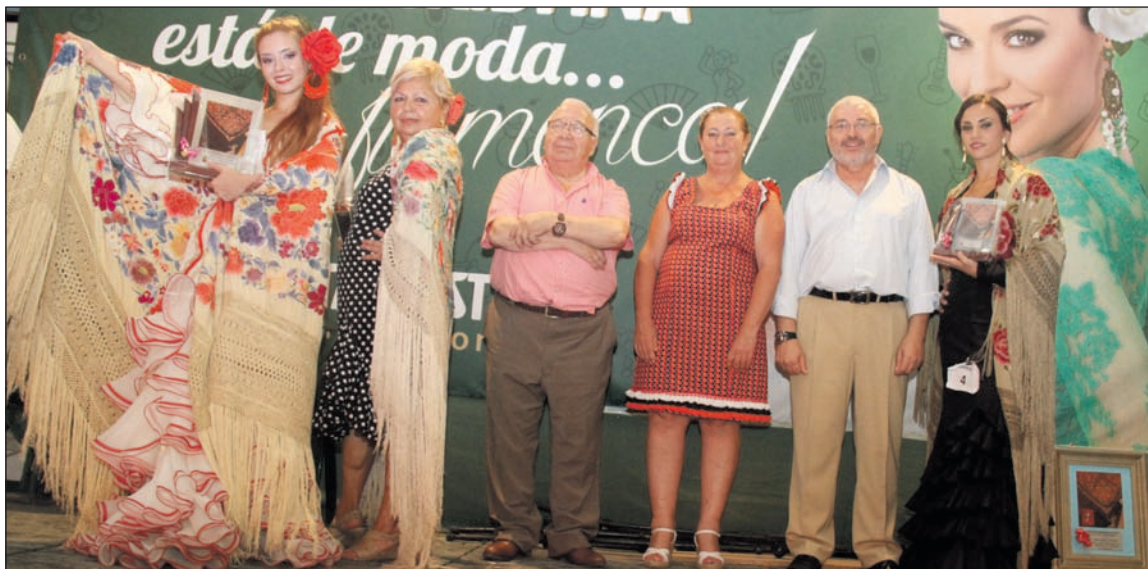
Entrega de premios en el certamen del pasado año.

◆ Federación Malagueña de Peñas, Centros Culturales y Casas Regionales 'La Alcazaba'