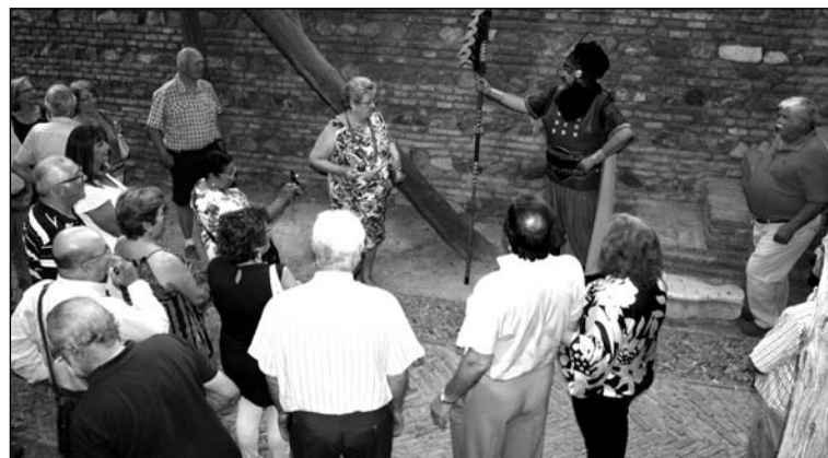
Un instante de la visita al interior del recinto.