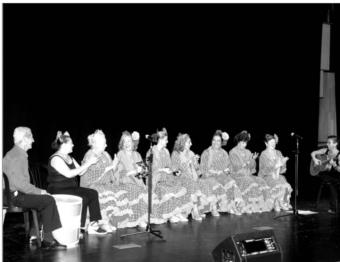
Uno de los coros participantes en la gala de presentación.