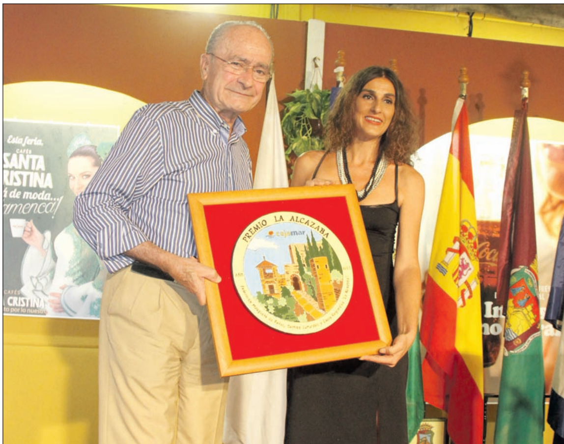
Entrega del premio el pasado año a la Asociación de Enfermos y Donantes de Órganos para Trasplantes.