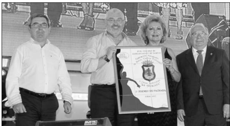
Entrega del premio de fachadas a la Peña La Paz.

fue para la Peña Perchelera y la Peña Santa Cristina; mientras que en interiores fue para la Asociación Cultural Los Cubatas y la Asociación Cultural Recreativa La Jarana, respectivamente.