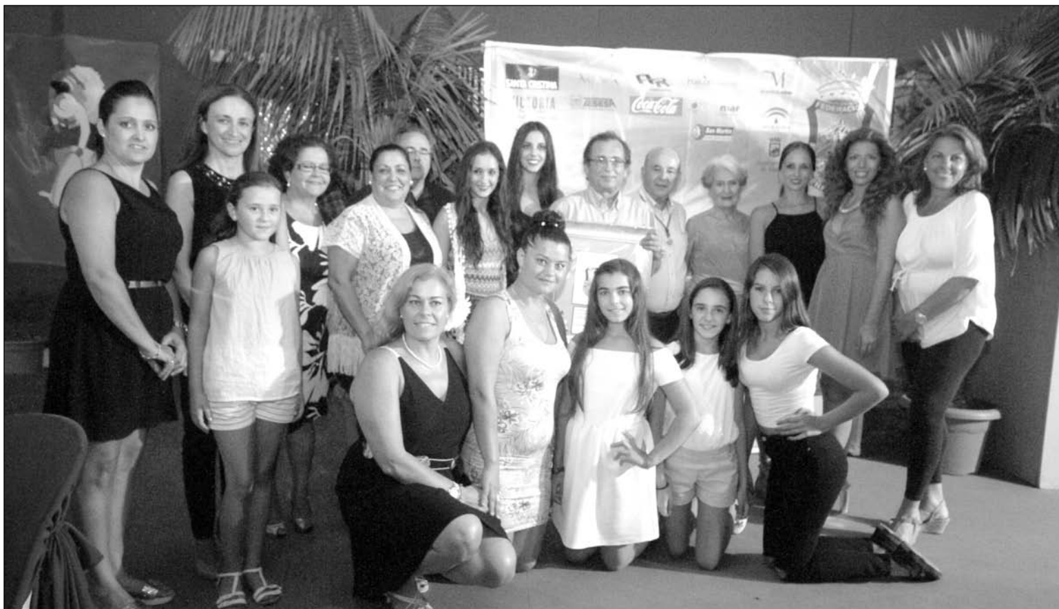
Componentes de Solera en la caseta de la Federación Malagueña de Peñas con el premio recibido en 2015.