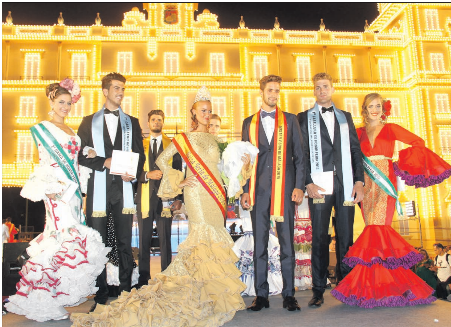
La Reina y el Mister, con sus Damas y Caballeros de Honor.