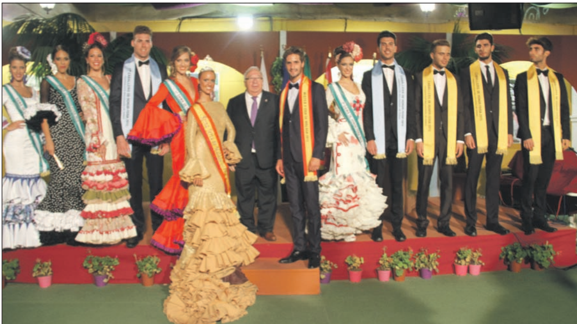
El presidente de la Federación, con los ganadores en la recepción posterior celebrada en la caseta de La Alcazaba.