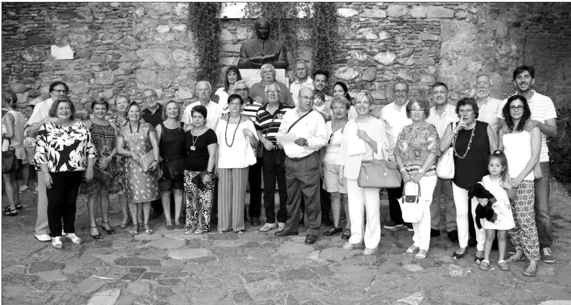
Grupo de visitantes de la Federación Malagueña de Peñas, Centros Culturales y Casas Regionales 'La Alcazaba'.