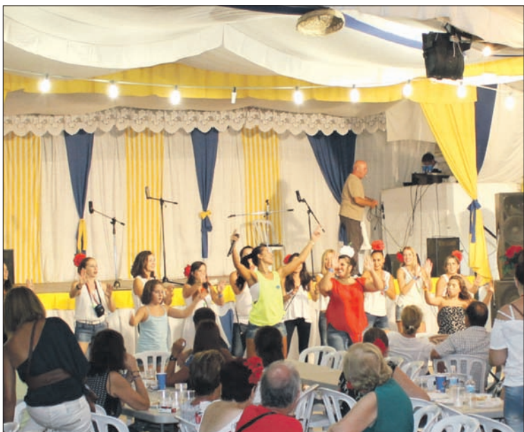
Ambiente en la caseta de la Peña Los Corazones el pasado año.