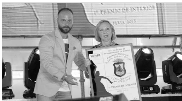
Entrega del premio de interiores de 2015 a la Peña Los Mimbrales.