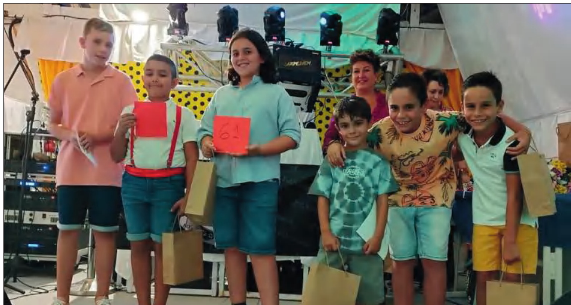
Aspirantes a bastoneros infantiles.