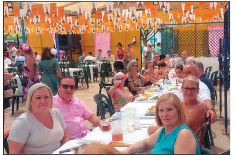
Comida de socios del miércoles de feria.