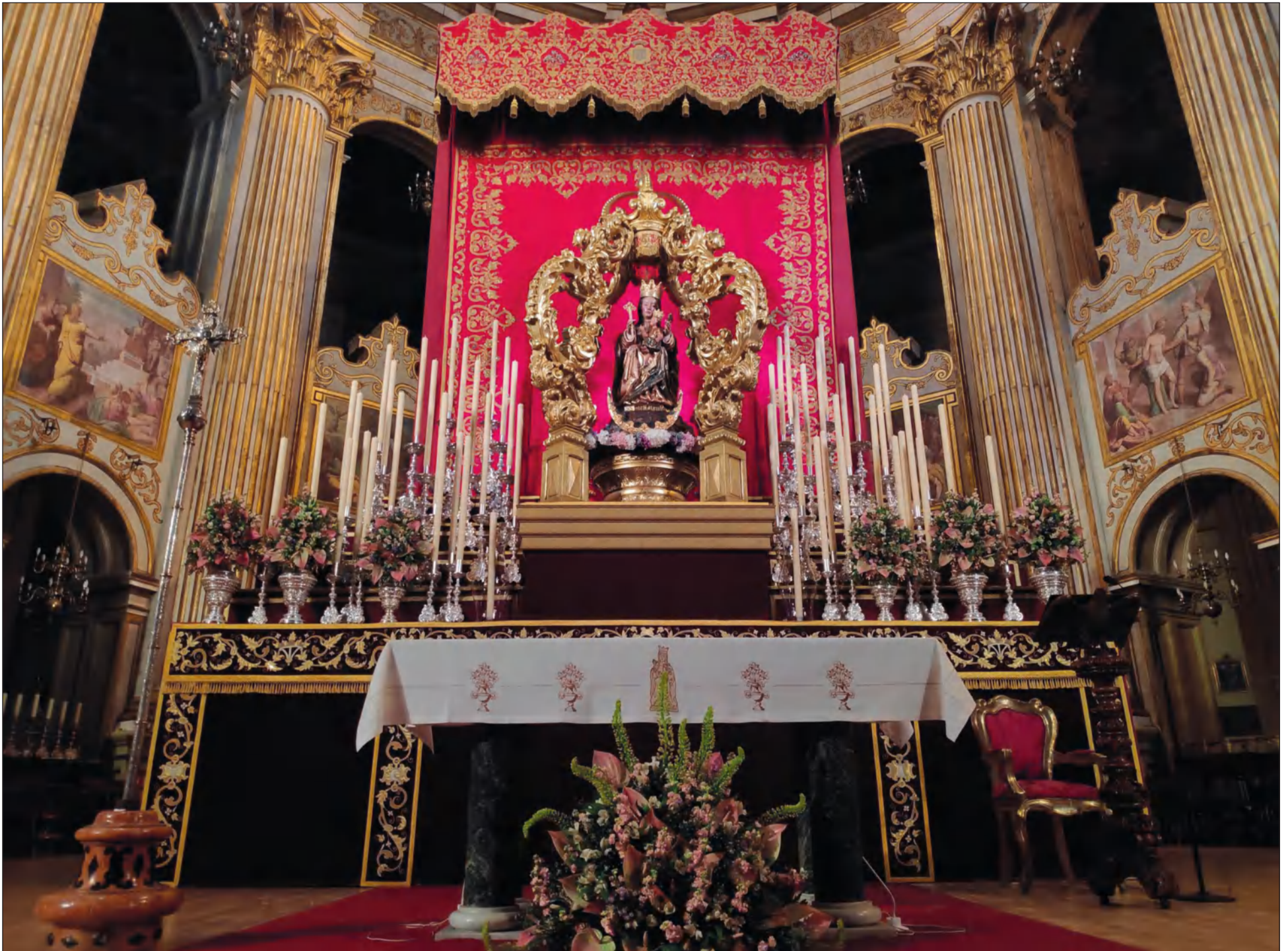
Santa María de la Victoria, en el Altar Mayor de la Catedral para su Solemne Novena.

• FEDERACIÓN MALAGUEÑA DE PEÑAS, CENTROS CULTURALES Y CASAS REGIONALES 'LA ALCAZABA'