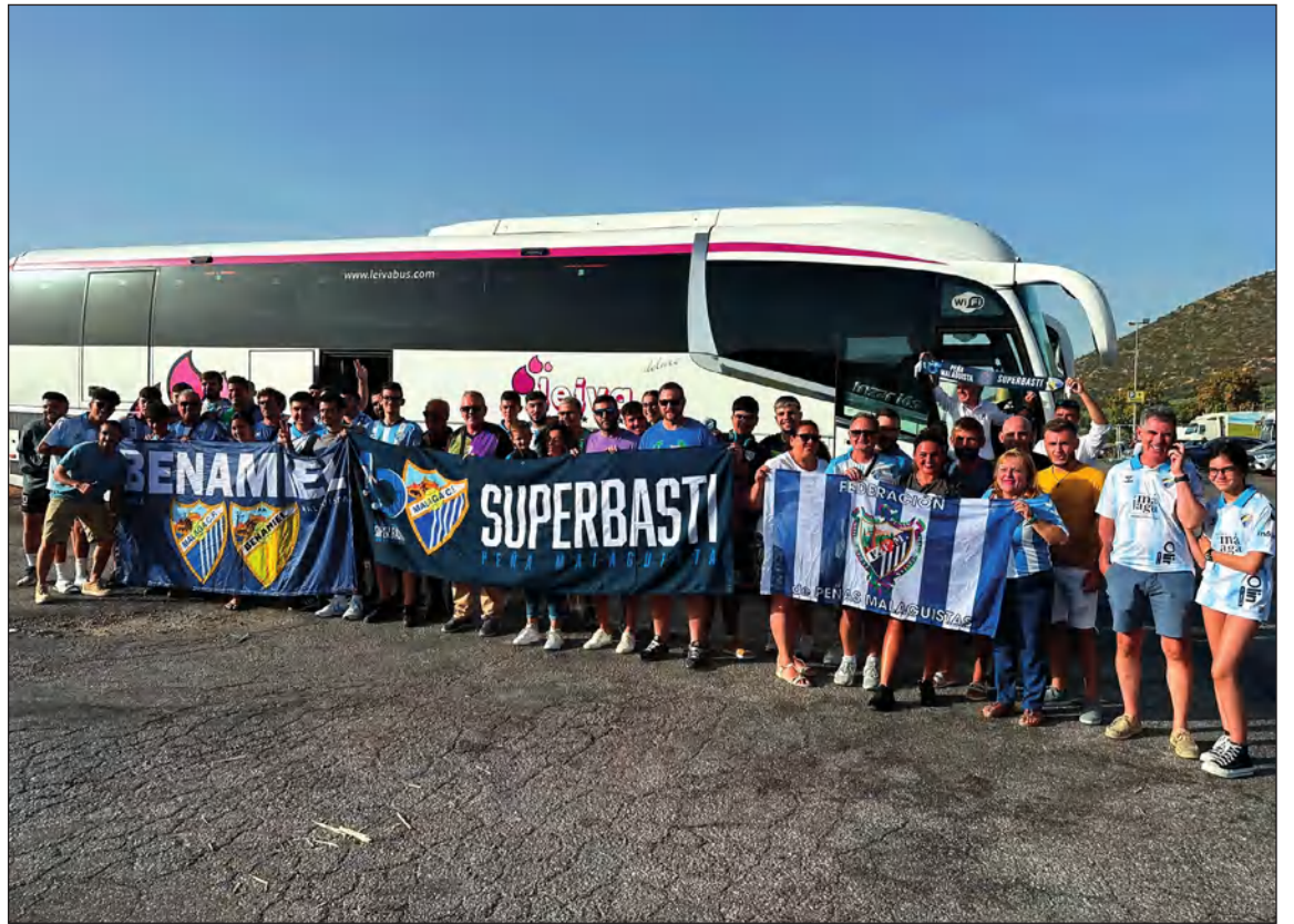
Integrantes de la excursión organizada por la Peña Super Basti a Castellón el pasado 26 de agosto.