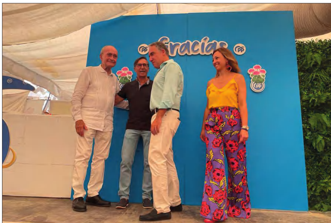
Entrega del premio a Cruz Roja.