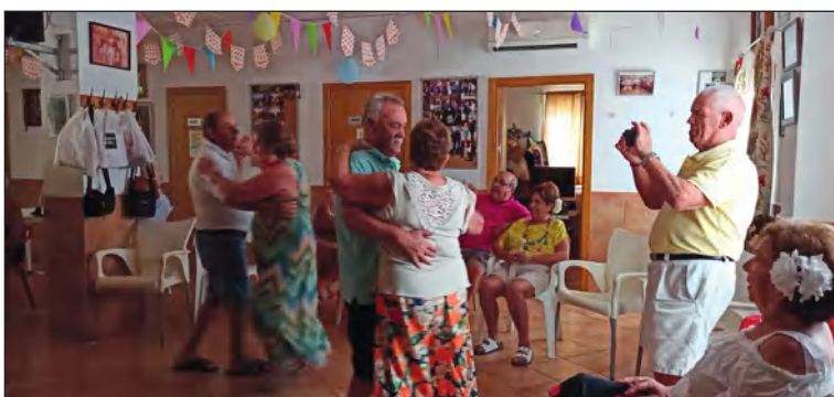
Baile en la sede de la entidad.