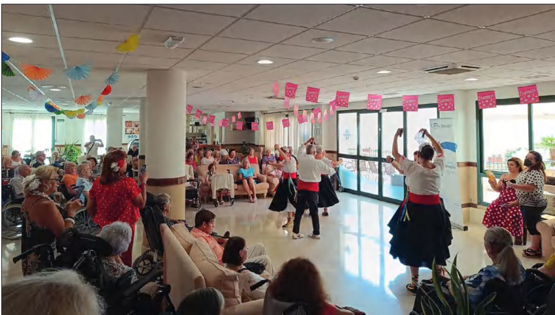
Los mayores de la Residencia Orpea disfrutaron de un día de Feria con la Asociación Victoriana.

la Feria con la elección de su Reina y Mister (ambos elegidos ganadores en el Certamen de la Federación Malagueña de Peñas), han visitado la caseta El Rengue, o han asistido a eventos como el almuerzo solidario en el Hotel Málaga Palacio del Club los Leones a favor de la Asociación de Autismo Málaga.