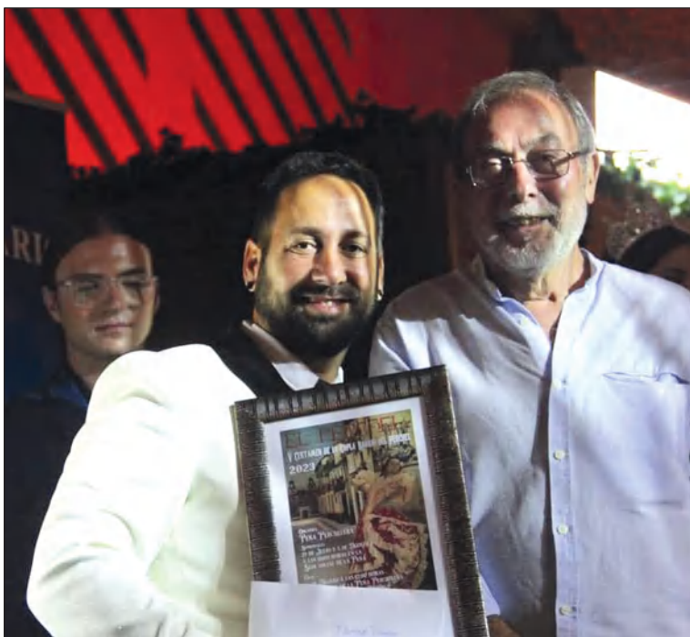
Entrega del primer premio del certamen.