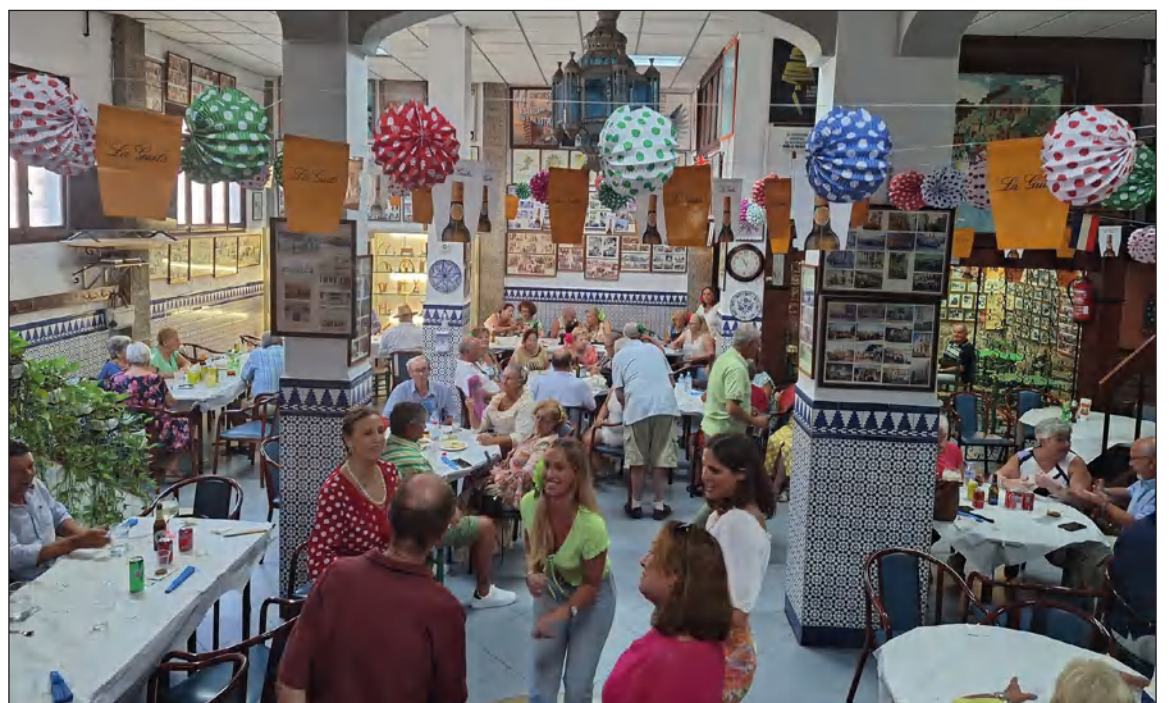
Ambiente de Feria en la sede de la entidad.

del año como es su Concurso Nacional de Albañilería 'Certamen Manuel Peláez Santiago', que tendrá lugar en la plaza del Padre Ciganda, junto a las Playas