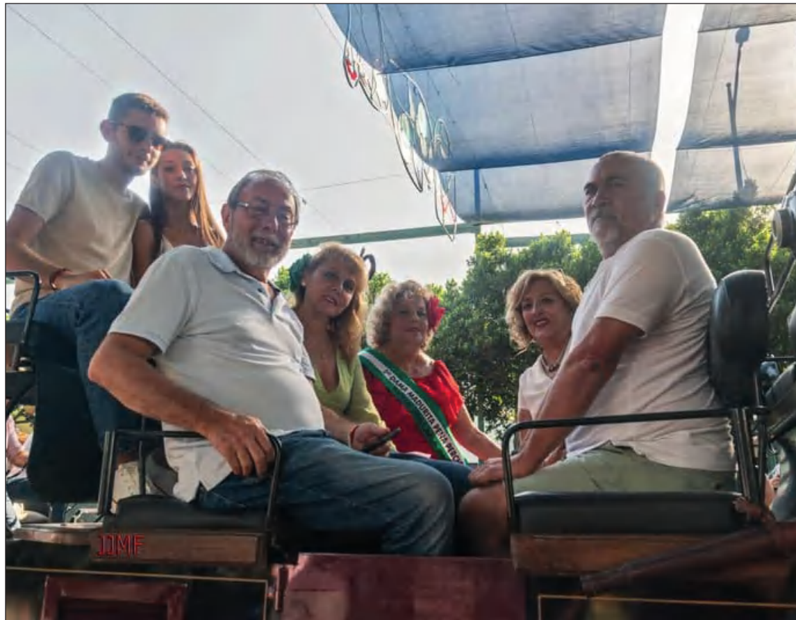
Socios de la Peña Perchelera en un coche de caballos por el Real de Cortijo de Torres.