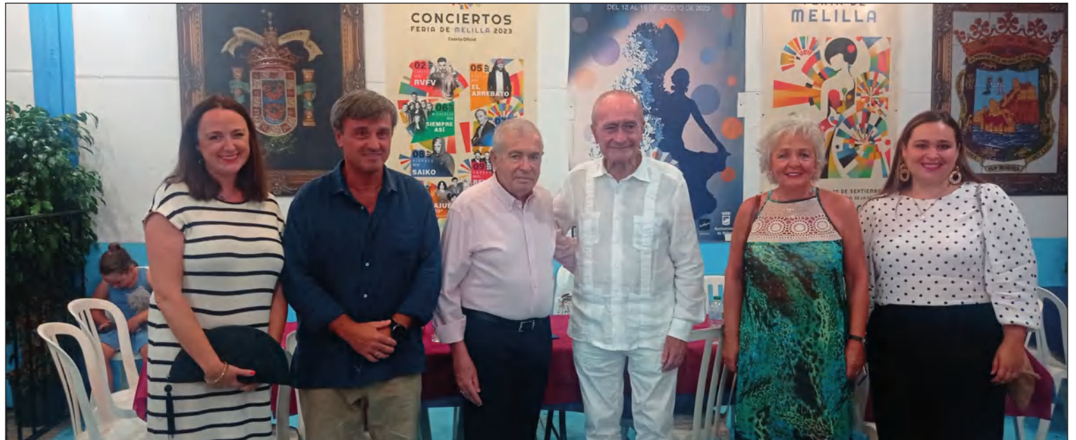
El alcalde Francisco de la Torre, con algunos de los concejales en su visita a la caseta de la Casa de Melilla en Málaga.