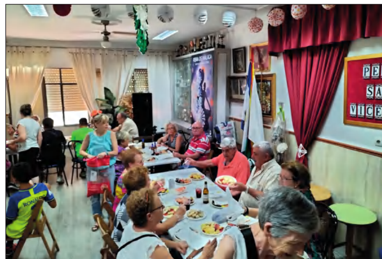
Celebración de la Feria en la sede.

No obstante, los socios no han dejado de visitar el recinto ferial de Cortijo de Torres, donde han podido disfrutar de casetas peñistas.