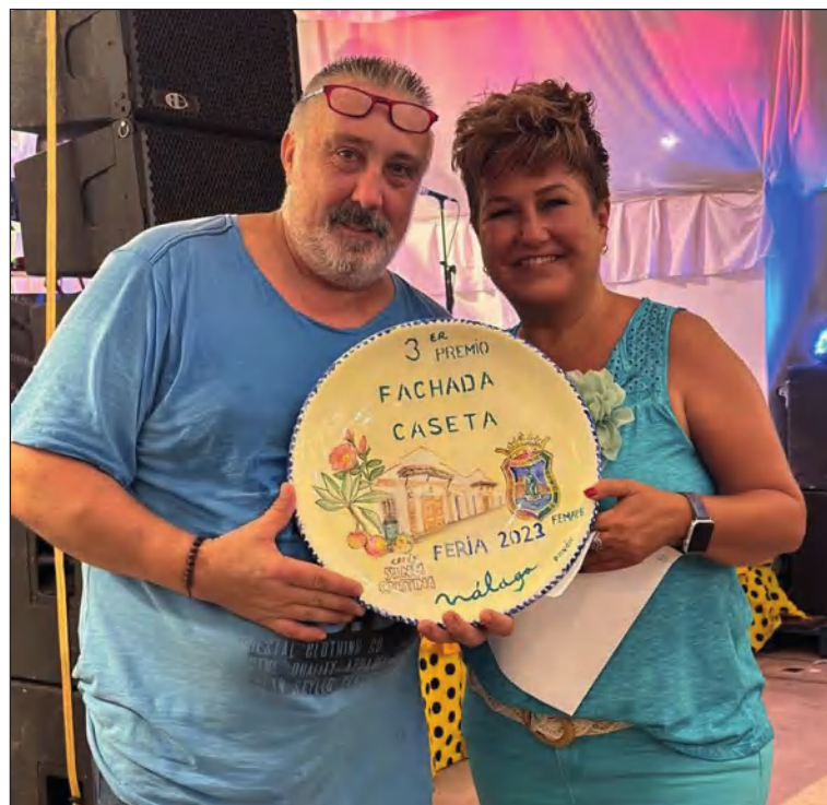
Tercer premio de fachadas.

Además, a la entidad le queda el orgullo de haber recibido el tercer premio del Concurso de Embellecimiento de Casetas en la categoría de Fachadas.