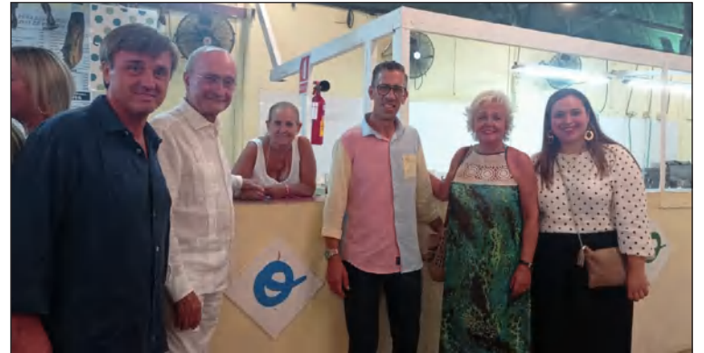
Representación municipal en la caseta de la Peña Santa Cristina.

Miles de personas han pasado por allí, han cantado y bailado, y disfrutado de la simpatía de sus socios. Entre los asistentes se encontró el alcalde y concejales.