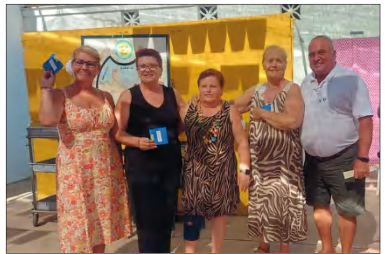
Entrega de trofeos de los campeonatos.