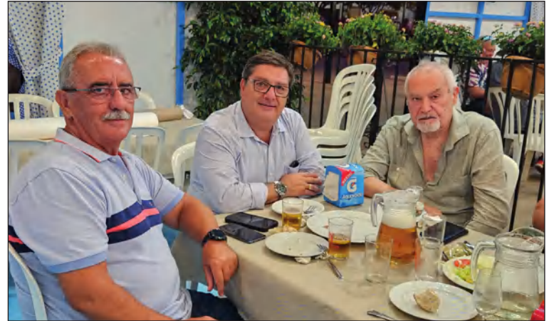
Visita de la Fundación Melilla Monumental

Caseta el Alcalde de Málaga, Francisco de la Torre, acompañado de varios concejales, el cual atendió con su habitual amabilidad al numeroso público que había en la Caseta y que se acercaron para hacerles comentarios y pedirle fotos.