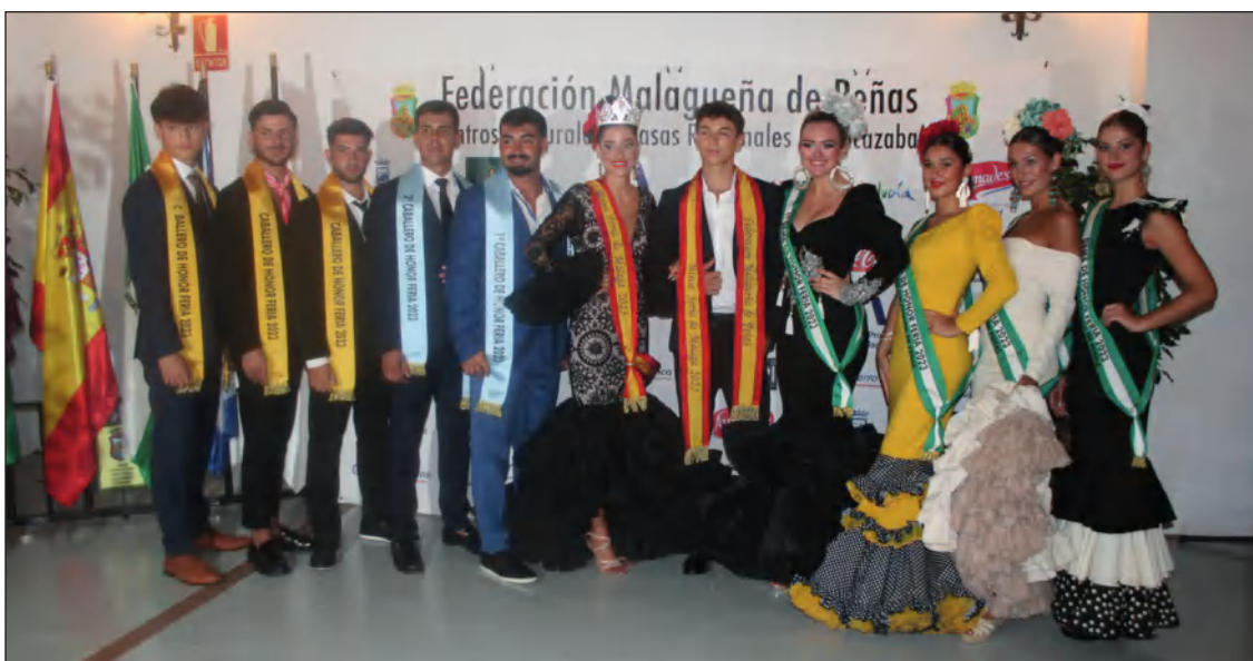
La Reina, el Mister, y las Damas y Caballeros de Honor representarán a los peñistas en la Festividad de la Patrona.