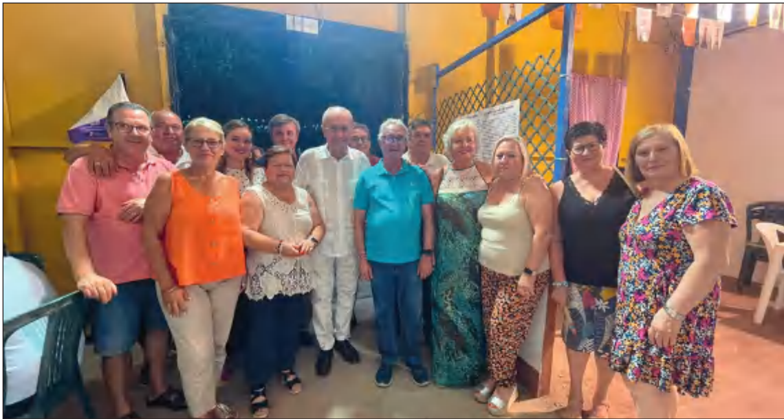
Visita del alcalde y representantes de la corporación municipal.

Entre las visitas destacadas se encuentra la del alcalde de Málaga, Francisco de la Torre.