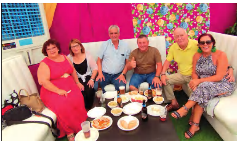
Visita de cortesía de una representación de la Federación Malagueña de Peñas.

Torres, que ha sido punto de visita obligado para los socios y simpatizantes de esta entidad perteneciente a la Federación de Peñas.