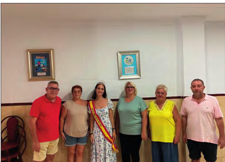
Elección de la Reina de la Peña Costa del Sol.