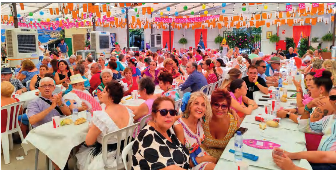
Socios de Hanuca en la caseta de la Peña Santa Cristina.

turales y Casas Regionales 'La Alcazaba' como es la Peña Santa Cristina, que les abrió de par en par las puertas de su caseta para que la sintieran como propia por un día.