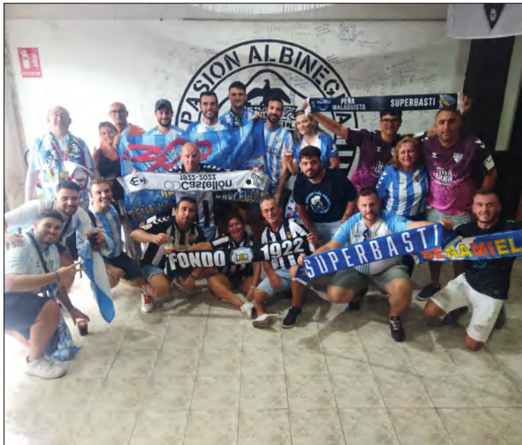
Hermanamiento con la Peña Pasión Albinegra.