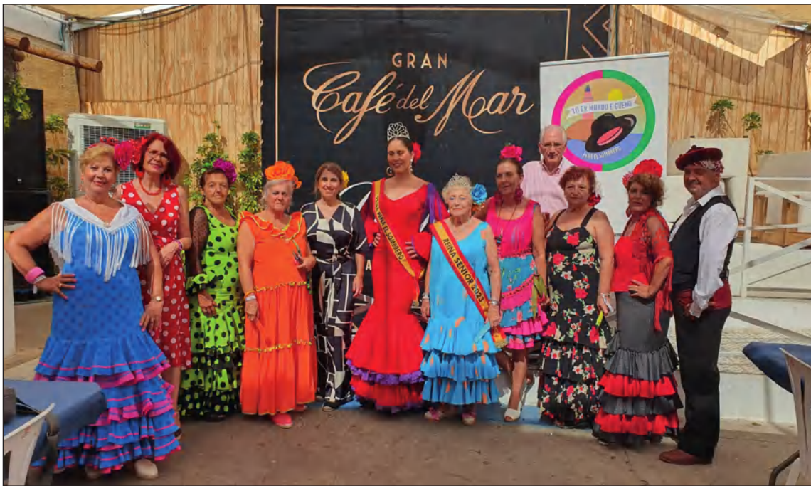
Socios ataviados de trajes tradicionales.

tado actuaciones de artistas como Raquel Framit, de su propio coro, y en el que se ha contado con Concurso de Mantones, entre otras propuestas.