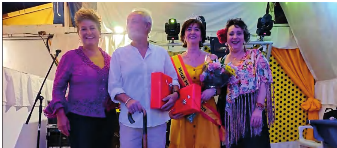
Bastonero y Reina Senior de la entidad.