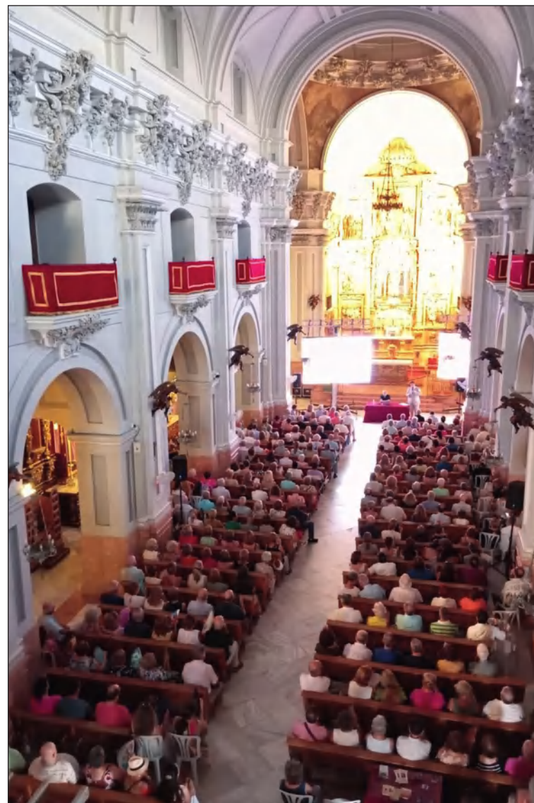
La conferencia causó gran interés y abarrotó el templo victoriano.