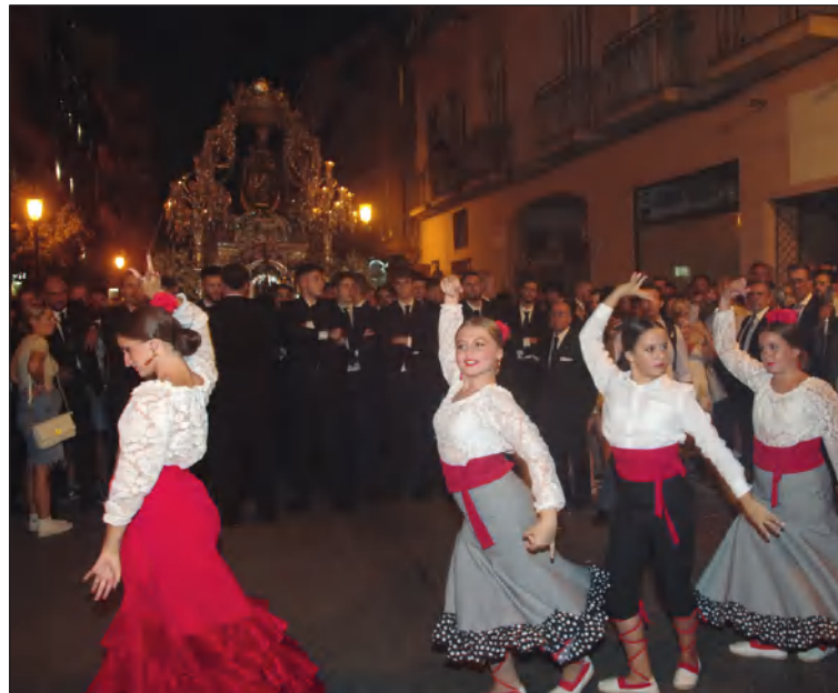
Baile ante la Virgen de la Victoria en la procesión del pasado año.

Para nosotros los peñistas, por supuesto que es importante, y mucho.