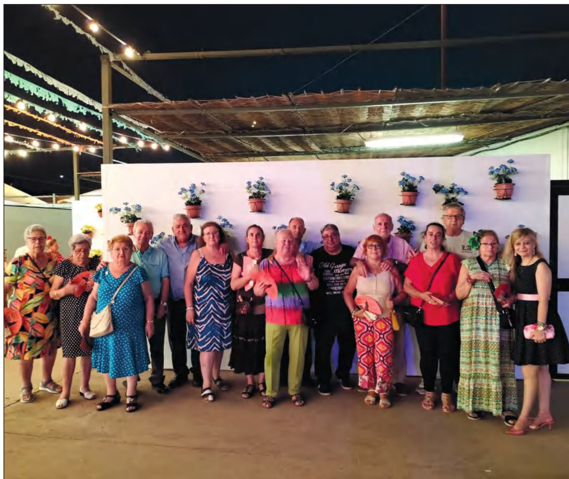
Visita a Cortijo de Torres de socios de la Peña San Vicente.