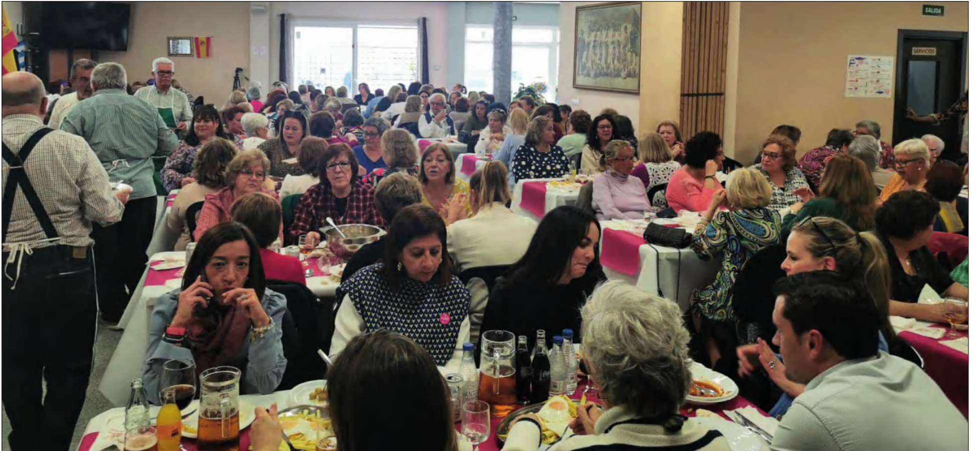
Actividad celebrada en marzo con motivo del Día Internacional de la Mujer en la sede de la Peña Tiro Pichón.

• FEDERACIÓN MALAGUEÑA DE PEÑAS, CENTROS CULTURALES Y CASAS REGIONALES 'LA ALCAZABA'