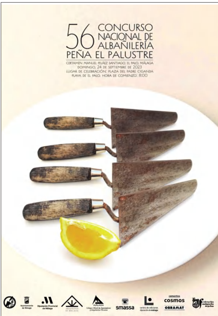
Cartel del concurso 2023.