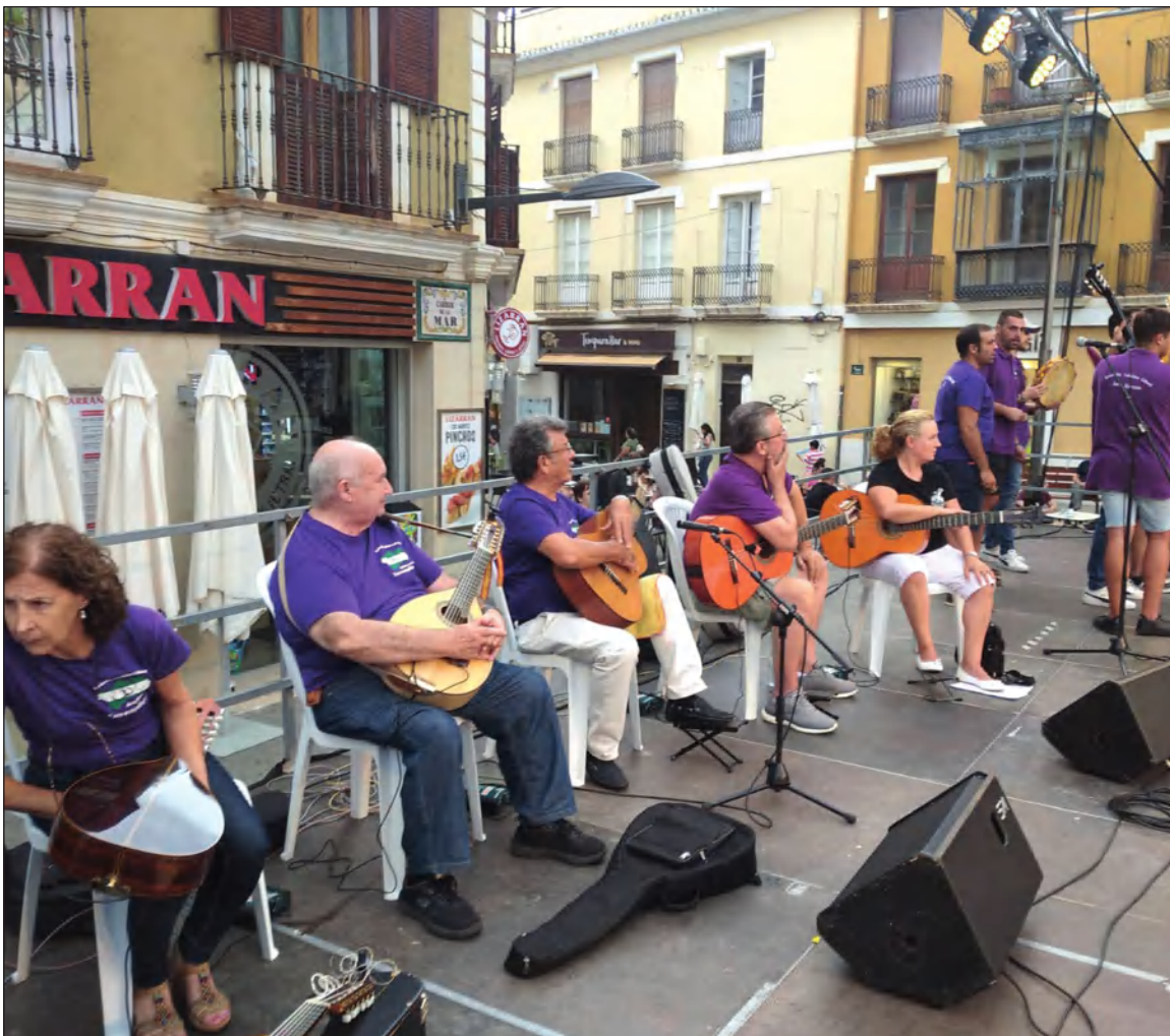
Ensayo de la actuación que finalmente tuvo que ser cancelada.