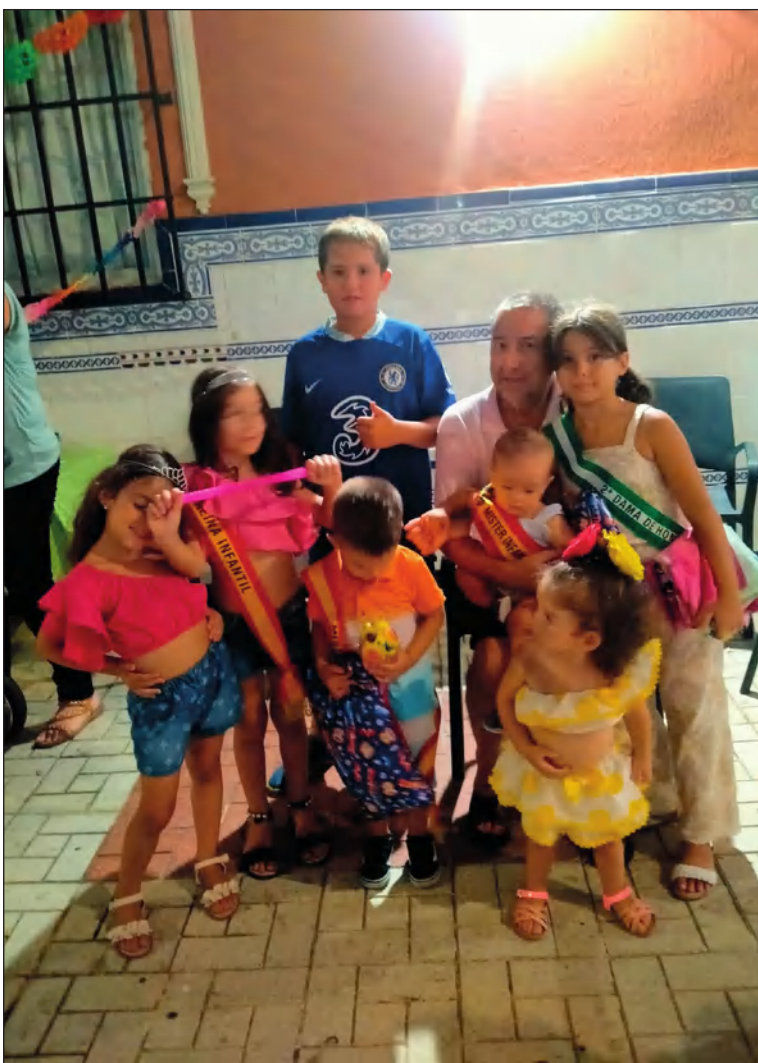
Elección de reina y mister infantil.

También se han seleccionado sus reinas y misters infantiles, en el transcurso de una fiesta dedicada a los más pequeños de la entidad.