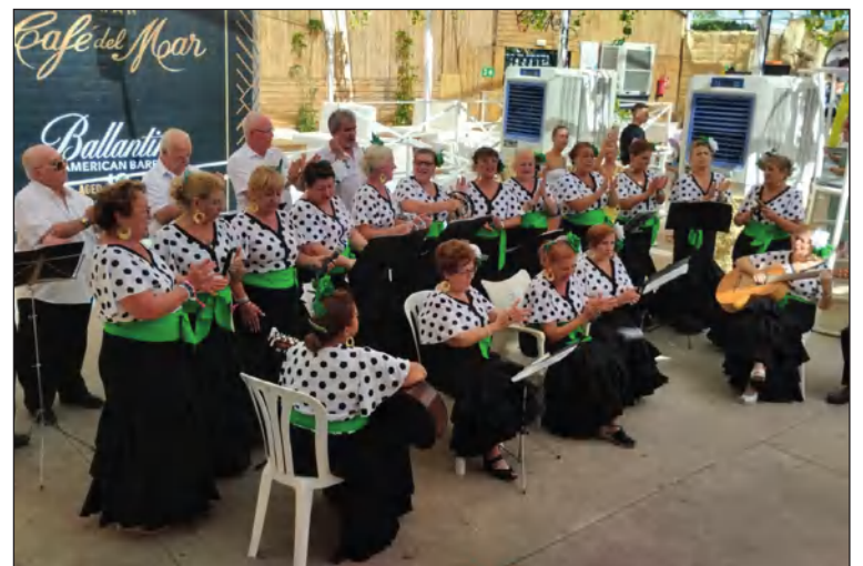
Coro Son de Málaga en la caseta.