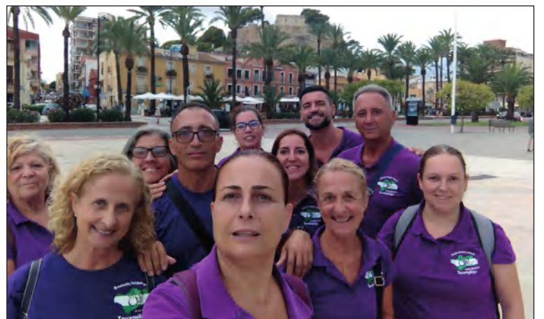
Componentes de la agrupación en Denia.

La Asociación Juan Navarro compartía cartel con el Grupo Naz Danza Teatro de Kazajistán y Dianium Dansa de Denia.