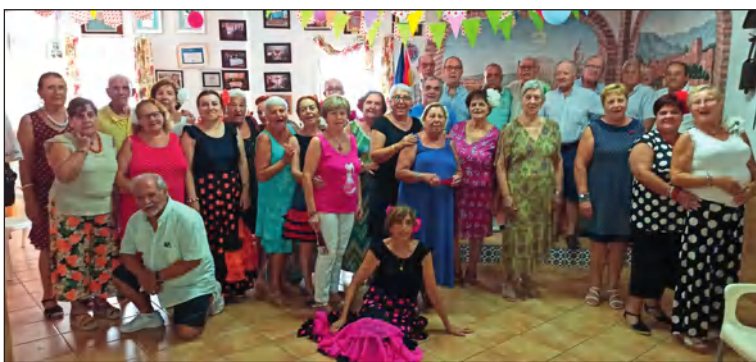
Imagen de grupo.