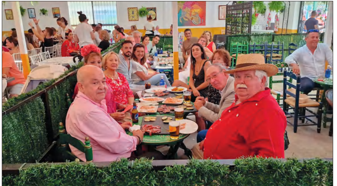
Visita del presidente de la Federación Malagueña de Peñas.