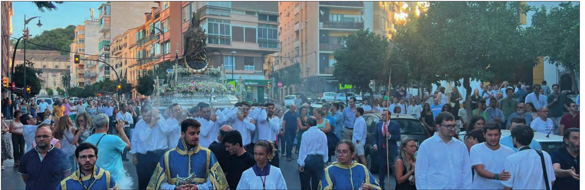
La Virgen era trasladada a la Catedral en la mañana del pasado domingo 27 de agosto.