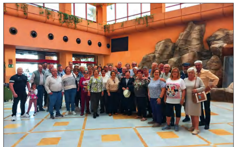
Imagen de grupo en el hotel donde se alojaron.

disfrutaron de un fin de semana cargado de buenos momentos para los integrantes de esta entidad perteneciente a la Federación Malagueña de Peñas, Centros Culturales y Casas Regionales 'La Alcazaba'.