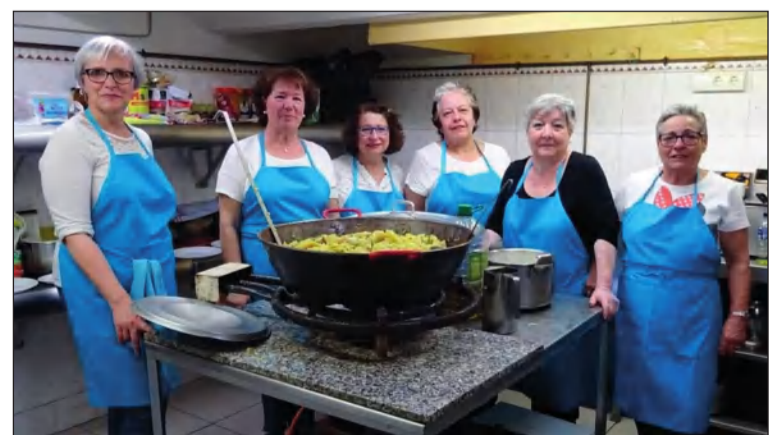
Grupo de las Super Nenas, encargado de la última comida.