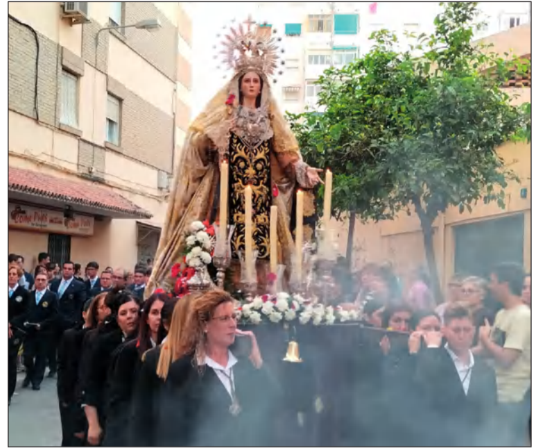
La Virgen de Dolores y Esperanza.