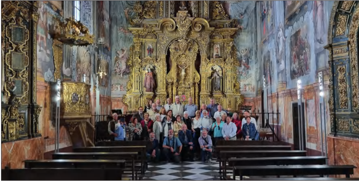
Componentes de la entidad durante su visita a la localidad granadina.