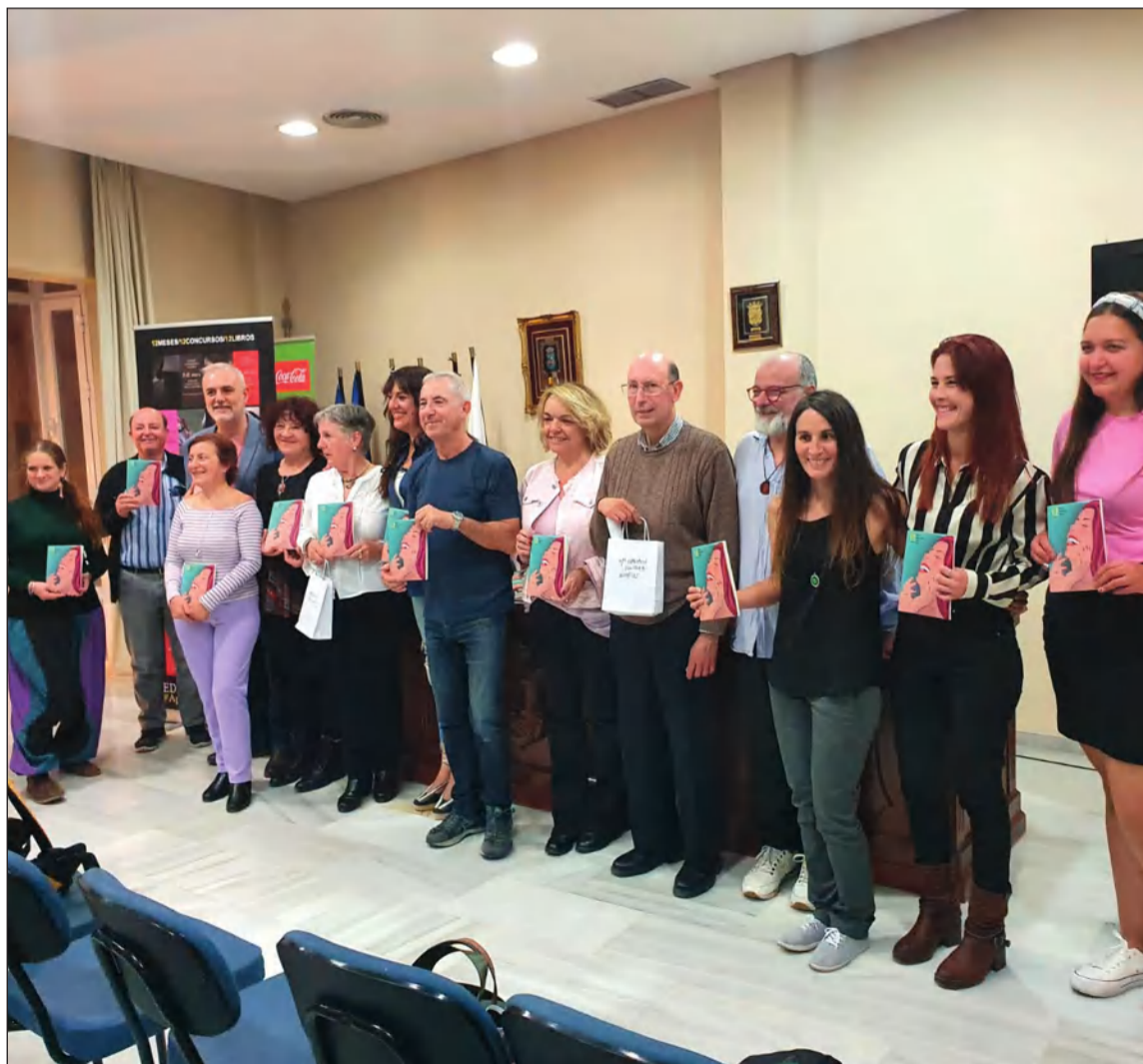
Participantes en esta obra presentada.

La temática del próximo concurso será, "Tema Romántico", por lo que quien desee participar solo tiene que entrar en la web de editorial Anáfora y descargarse las bases o solicitarla al email docemeses@editorialanafora.com