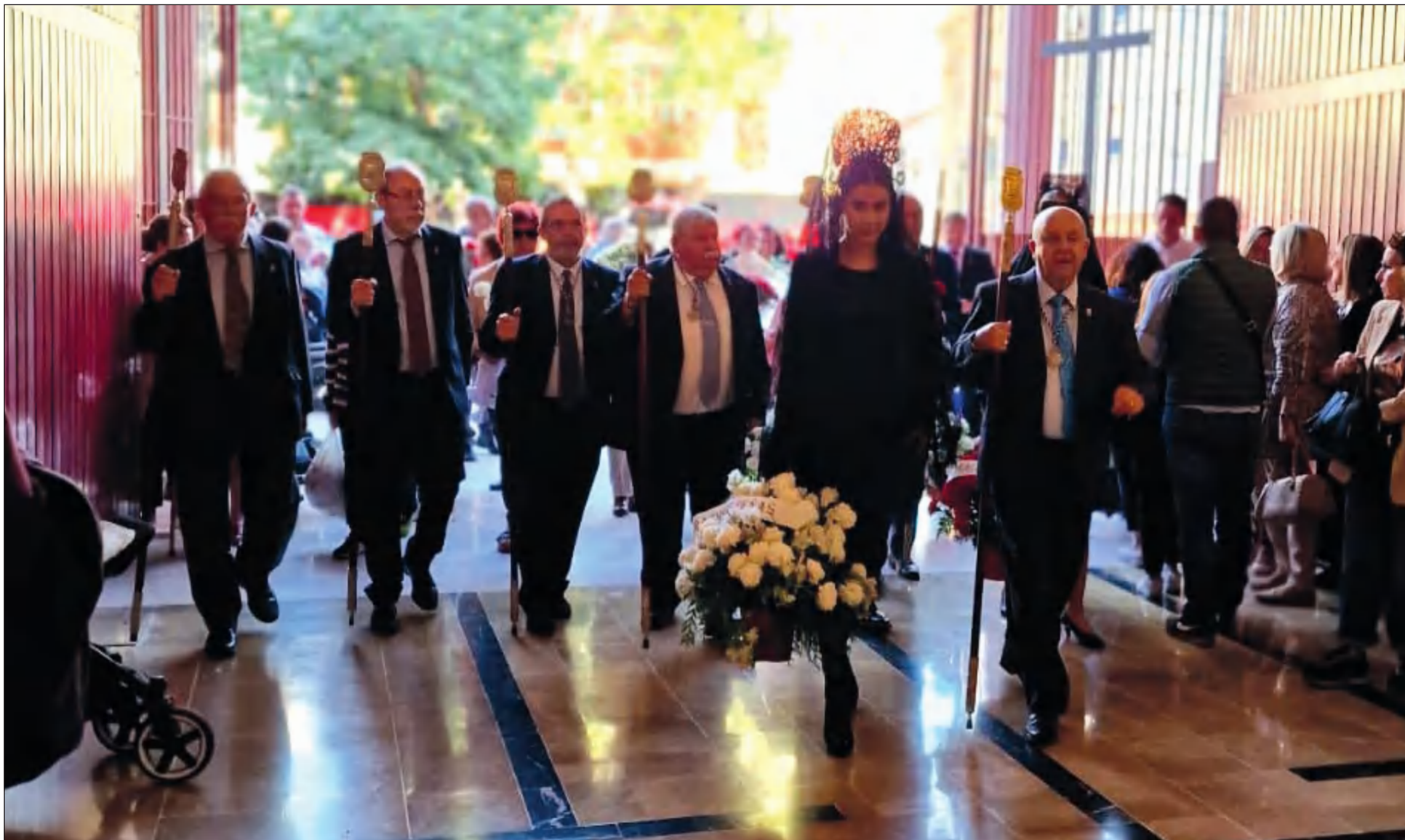
Comitiva peñista accediendo al interior de la Casa Hermandad de la Cofradía del Rocío para realizar su Ofrenda Floral.

• FEDERACIÓN MALAGUEÑA DE PEÑAS, CENTROS CULTURALES Y CASAS REGIONALES 'LA ALCAZABA'