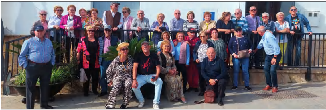
Socios de la Peña La Paz en su excursión del Día del Padre a Ardales.