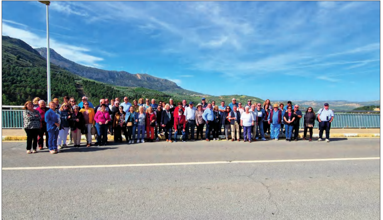
Visita al Pantano de Iznájar.

Tras el almuerzo, se podía disfrutar de un baile y una agradable velada de confraternidad antes de regresar a nuestra capital con la satisfacción de haber descubierto otro de los bonitos pueblos de nuestra provincia de Málaga.