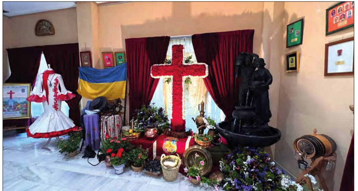
Cruz de Mayo montada por la Federación Malagueña de Peñas el pasado año en su sede.

Sobre esa base, ha llegado el momento de compartir nuestra alegría y nuestra ilusión con todos. Así que prepárense, porque se nos avecinan grandes momentos en esta Fiesta de la Cruz de Mayo que viviremos a lo largo de esta Primavera de 2023 en la Ciudad del Paraíso.