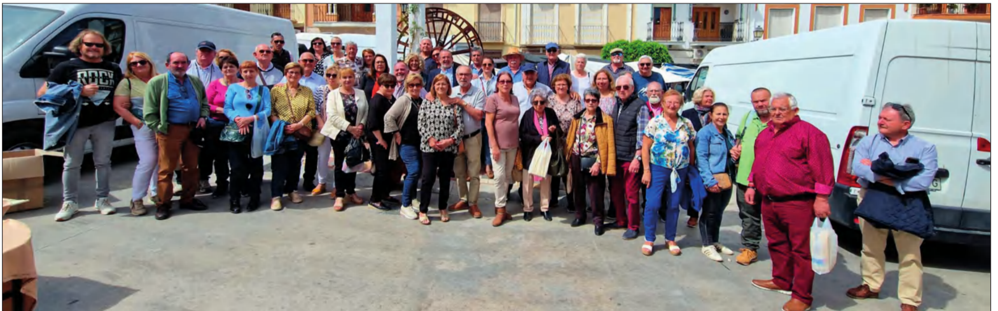
Peñistas en el casco urbano de Cuevas de San Marcos.