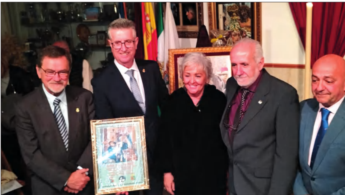
Pregón de la Peña San Vicente.

realizaba una ofrenda floral a la Venerable Hermandad Carmelita y Cofradía de Nazarenos del Santísimo Cristo de la Humildad y Paciencia, María Santísima de Dolores y Esperanza y Nuestra Señora de la Aurora durante su traslado.