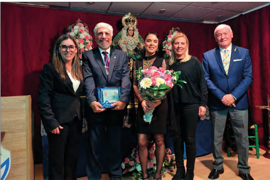
Pregon de Semana Santa de la Peña Nueva Málaga