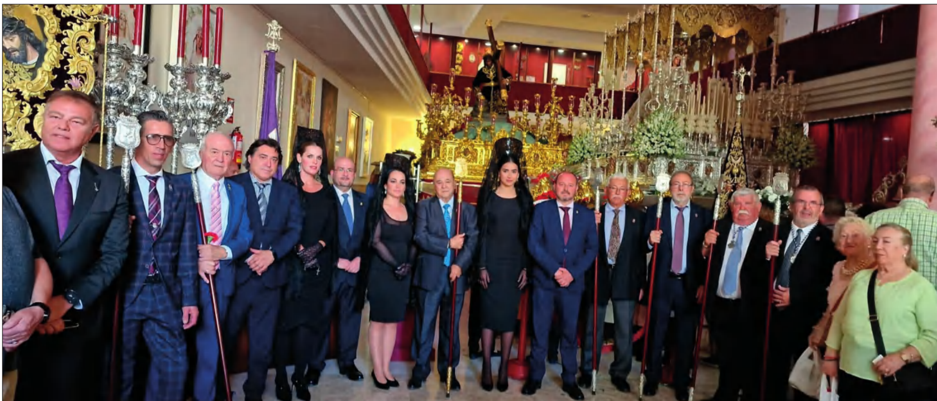
La Federación Malagueña de Peñas participaba, como todos los años el Lunes Santo, en la Ofrenda Floral 'Un Clavel para el Rocío', y dedicaba saetas a sus Sagrados Titulares en su Casa Hermandad.

Web: www.femape.com Edición digital: www.femape.com/laalcazabadigital Twitter: @FMPLaAlcazaba Facebook: FMPLaAlcazaba