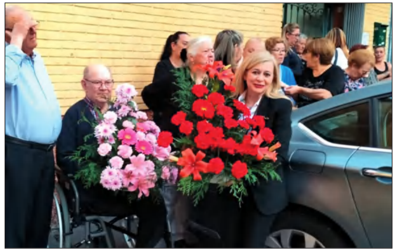
Ofrenda Floral a Humildad y Paciencia.