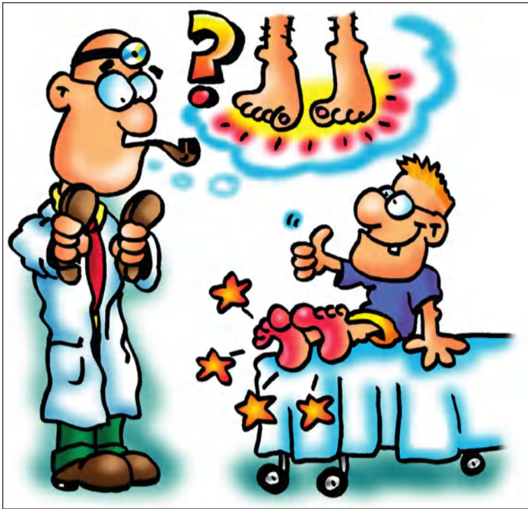
Ilustración de Enrique García.