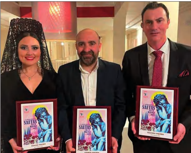
Los tres primeros clasificados con sus trofeos.