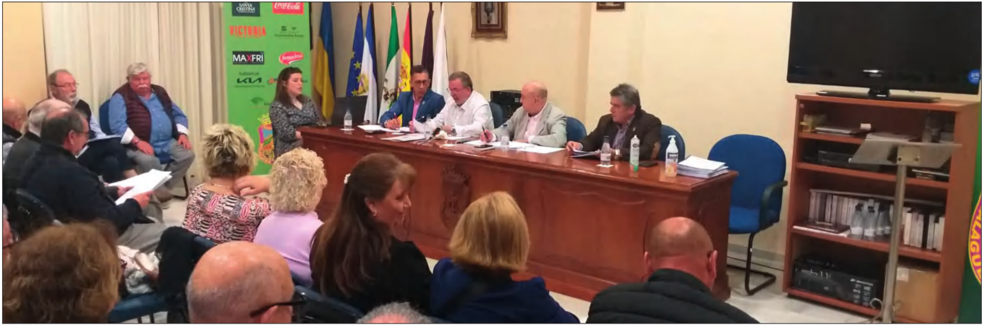
Vista general de la Asamblea General Ordinaria celebrada en la sede de la Federación Malagueña de Peñas el pasado 22 de marzo