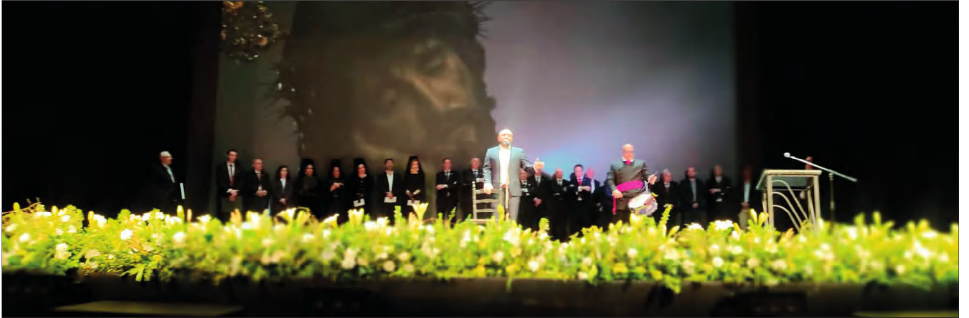
El ganador del XLVII Concurso interpreta una saeta ante los encargados de hacer la entrega de premios en el Teatro Cervantes.