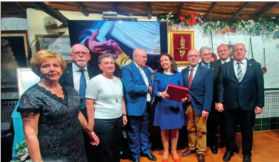
Imagen de grupo tras el Pregón de la Asociación Cultural Cortijo La Duquesa.