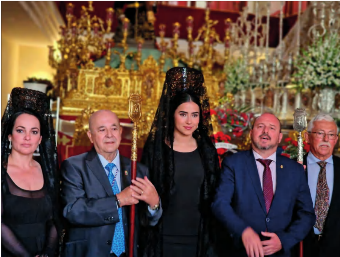
El Hermano Mayor del Rocío recibía a la comitiva peñista, con la presencia de la Reina de la Feria 2022.