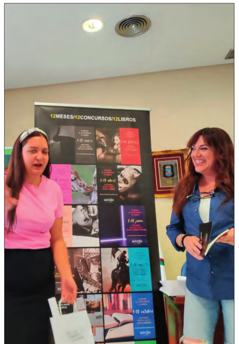
La presentación estuvo cargada de momentos divertidos.