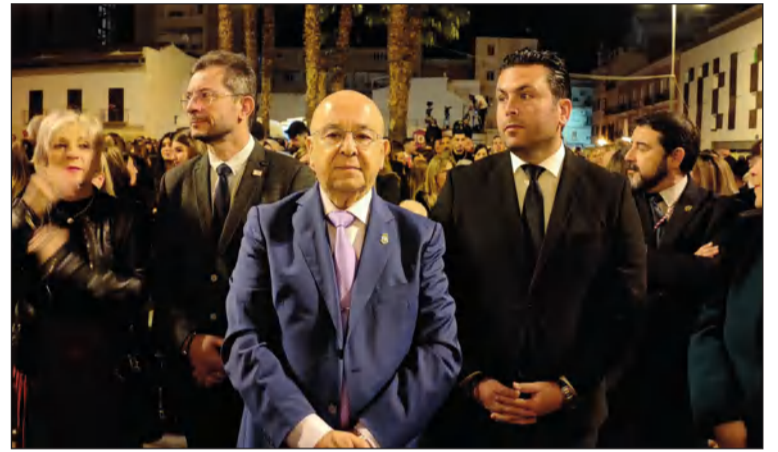
El presidente de la Federación, en la Misa del Alba.