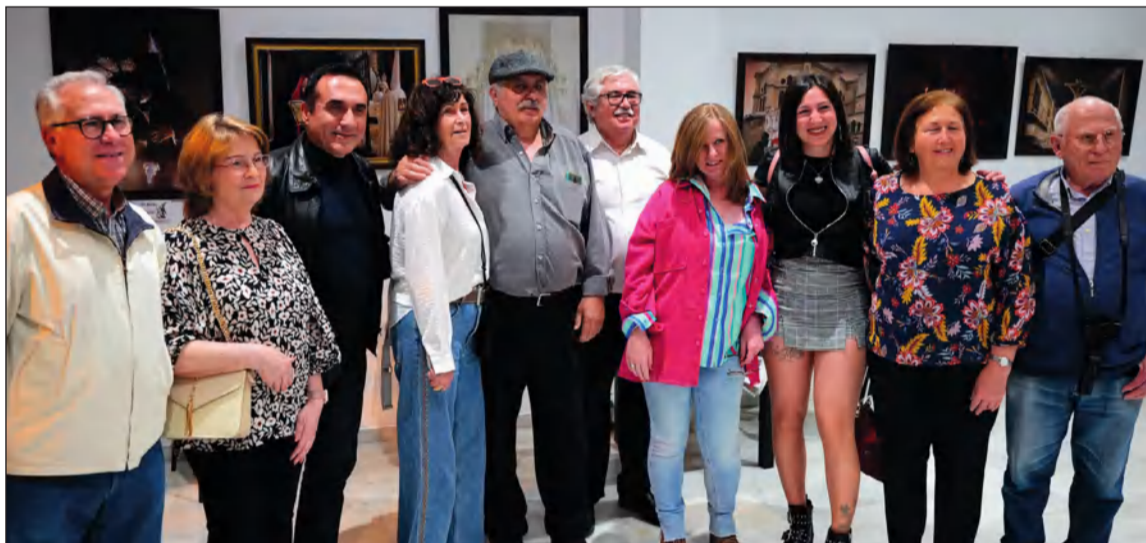
Asistentes a la presentación de la muestra del fotógrafo Pepe Moreno.