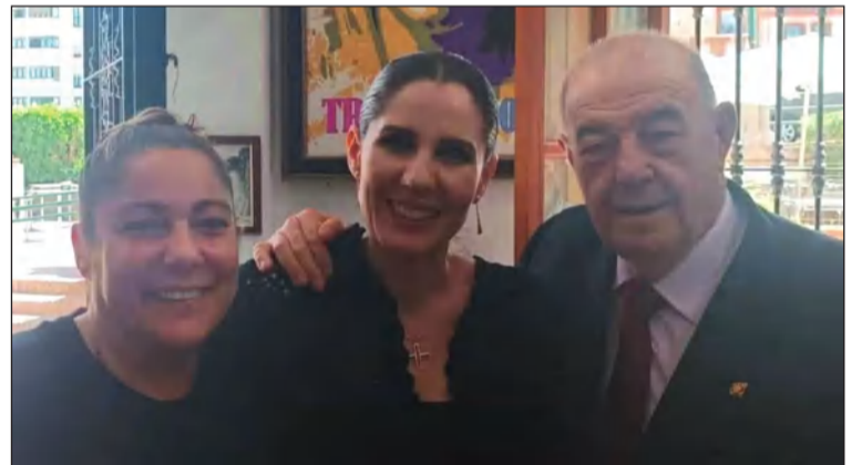
La cantante Diana Navarro, en la sede de la Peña Trinitaria.