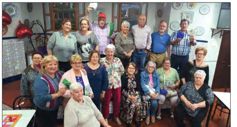
Acto de entrega de trofeos tras el torneo.

La entidad organiza para el Domingo de Resurrección una comida de hermandad,