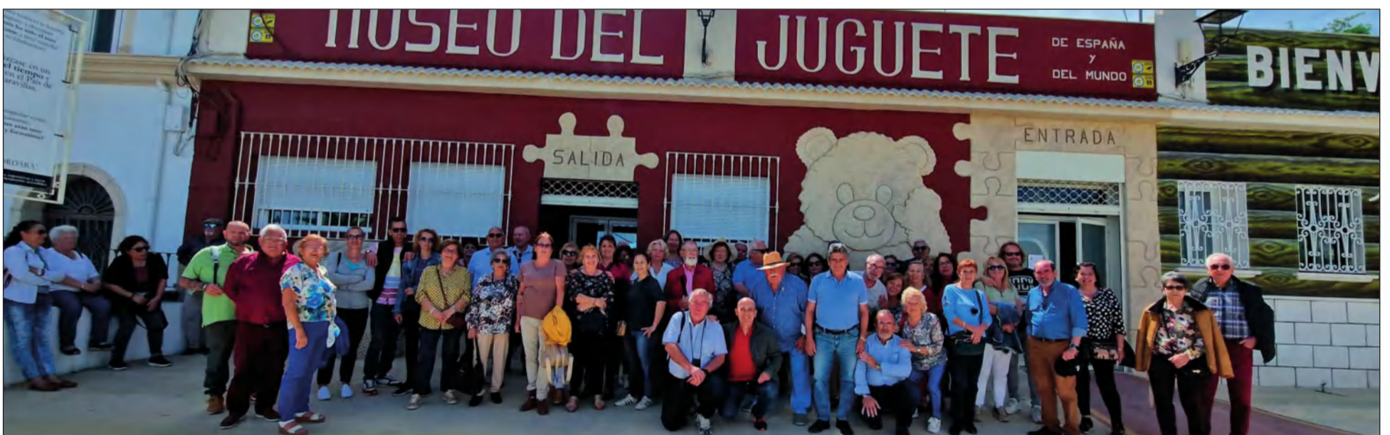
Museo del Juguete, de reciente inauguración.