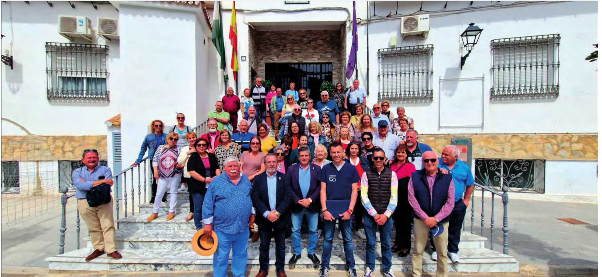
Recepción del Ayuntamiento de Cuevas de San Marcos.

• FEDERACIÓN MALAGUEÑA DE PEÑAS, CENTROS CULTURALES Y CASAS REGIONALES 'LA ALCAZABA'