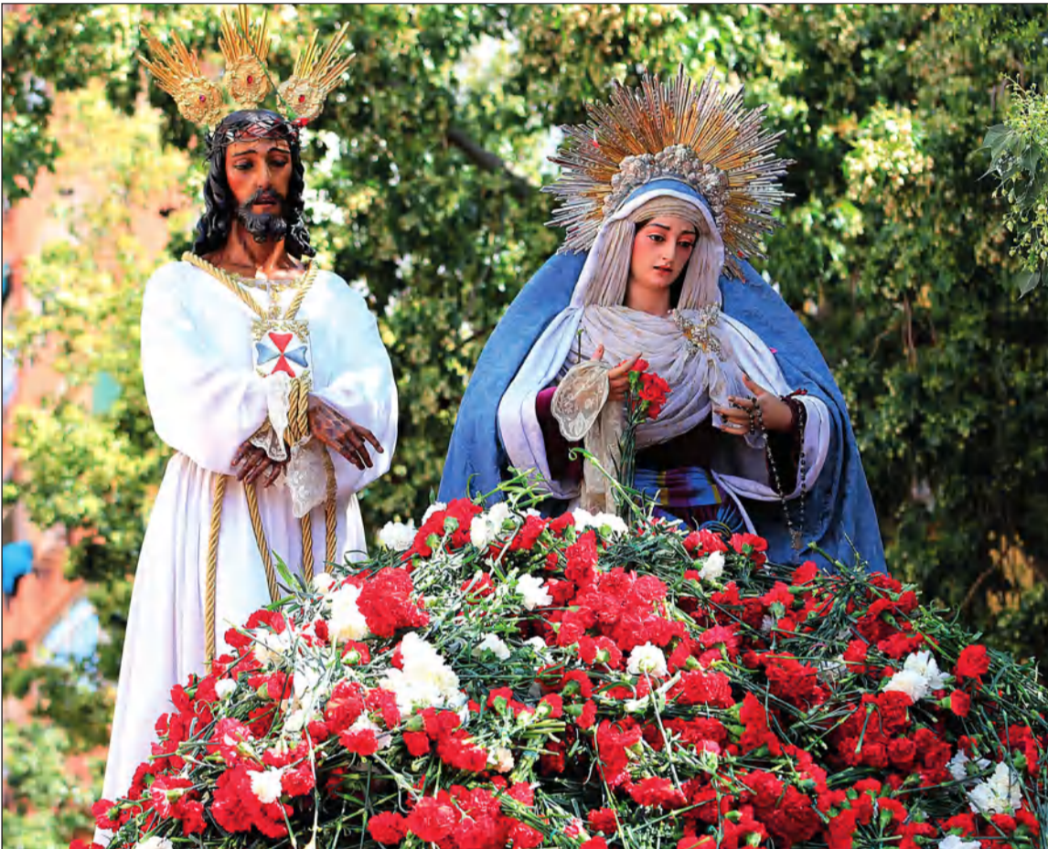
Jesús Cautivo y María Santísima de la Trinidad, durante su Traslado.

hacía la cantante Diana Navarro, quien posteriormente se desplazaba hasta la sede de la Peña Trinitaria.