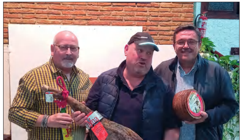
Entrega de premios del campeonato de Ranas.

Por otra parte, el sábado 25 de marzo se celebró su tradicional comida, organizada por el grupo de la Super Nenas, donde deleitaron con un succulento menú.