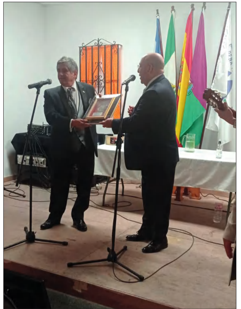
Entrega de un recuerdo de la Federación de Peñas.