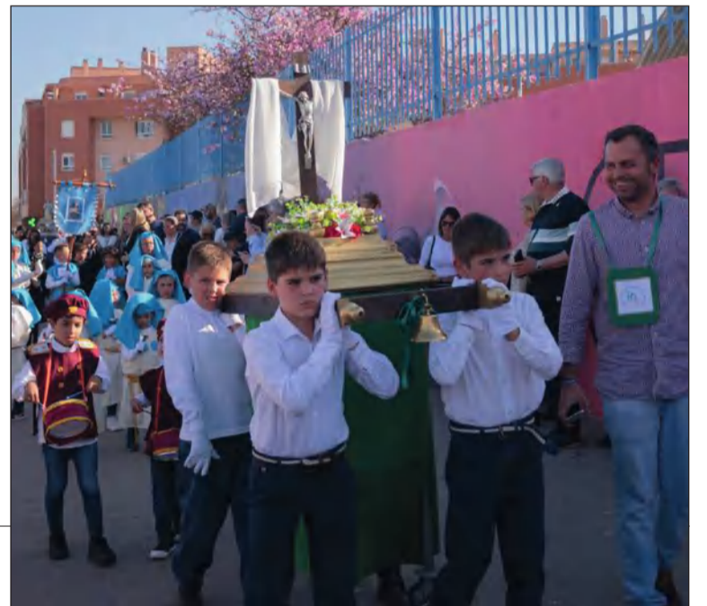
Numerosos niños formaron parte del cortejo procesional.

En esa jornada, además, se repartieron torrijas por parte de esta entidad perteneciente a la Federación de Peñas.