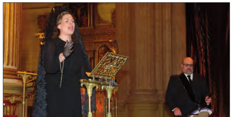
Oración Cantada en la Santa Iglesia Catedral de Málaga.

Pero una cosa debe quedar clara, por mucha voluntad que las peñas y las asociaciones tengan para conservar las tradiciones y para que sus esfuerzos no caigan en vano, las instituciones públicas deben de tener la responsabilidad de salvaguardar las tradiciones, entre ellas la saeta, apoyando y poniéndose al lado de los colectivos para que el legado cultural esté siempre presente en la sociedad.