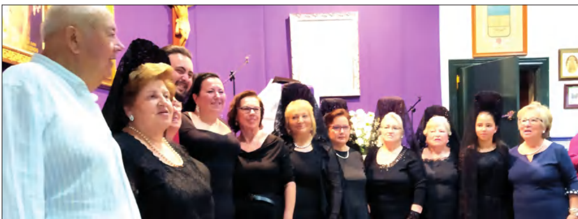
Acto cofrade en la Peña San Vicente.