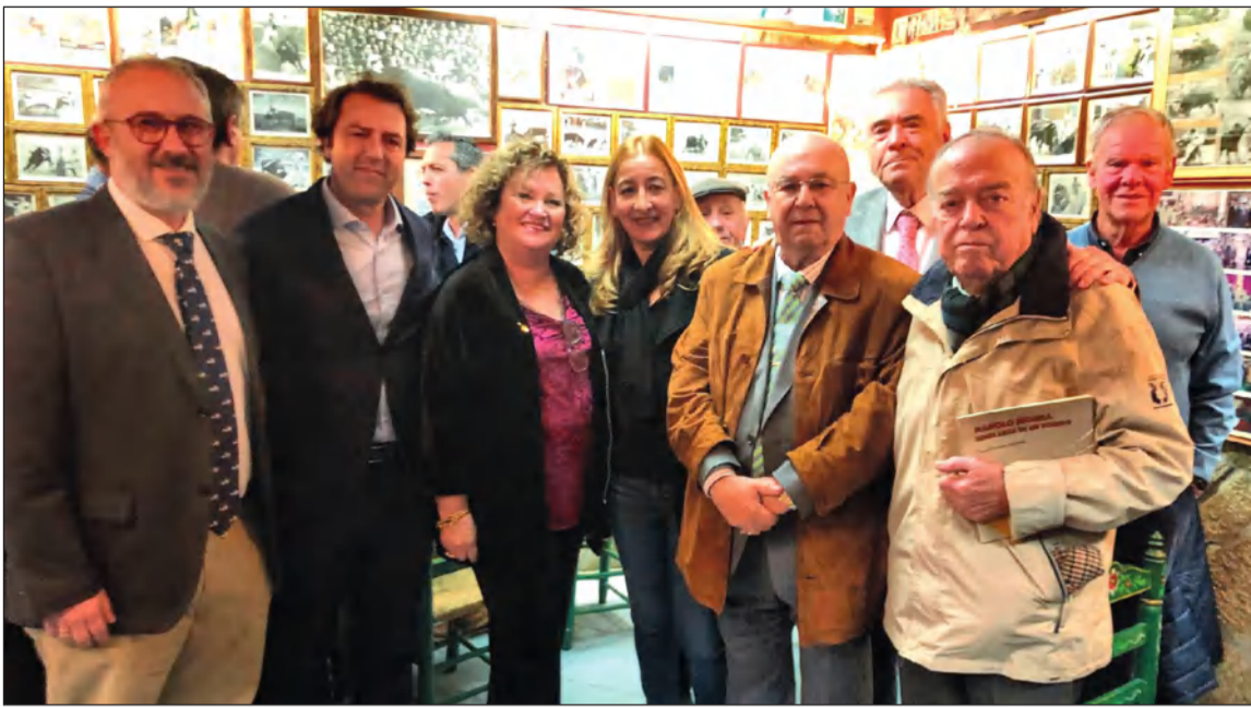
Participantes y asistentes a la Tertulia Taurina.