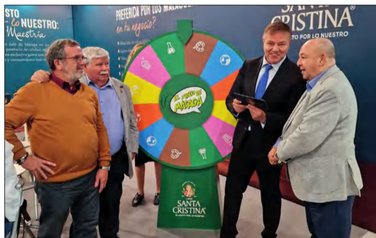
Cafés Santa Cristina contó con un stand en el Salón H&T.