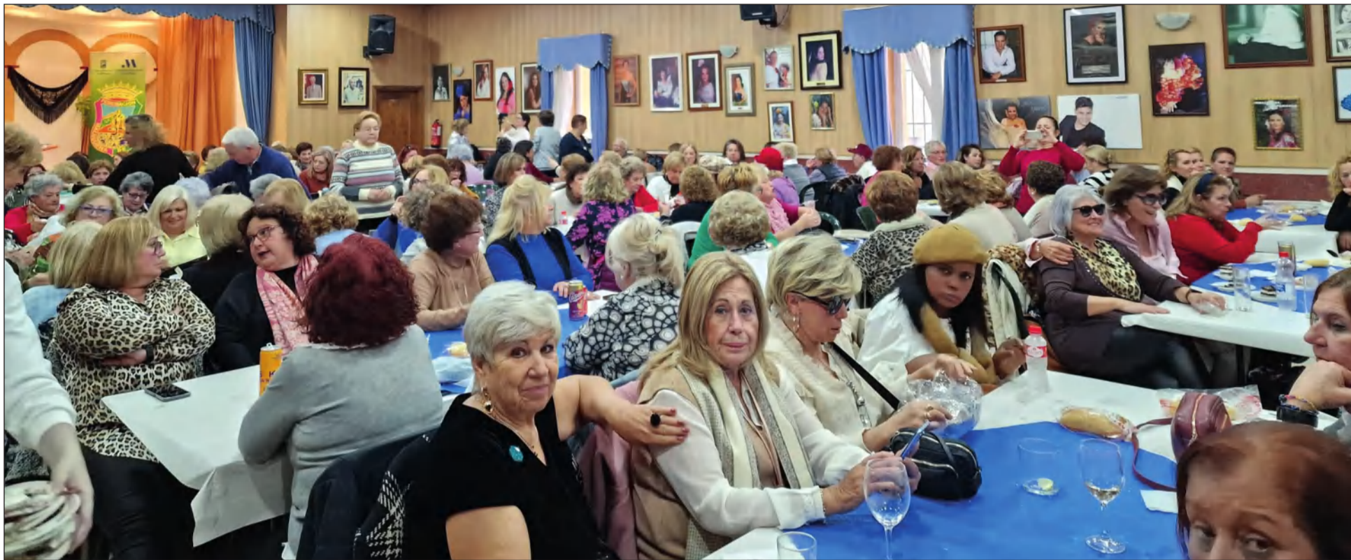
Vista general del salón de actos de la Casa de Álora Gibralfaro durante la Convivencia de Mujeres.

• FEDERACIÓN MALAGUEÑA DE PEÑAS, CENTROS CULTURALES Y CASAS REGIONALES 'LA ALCAZABA'