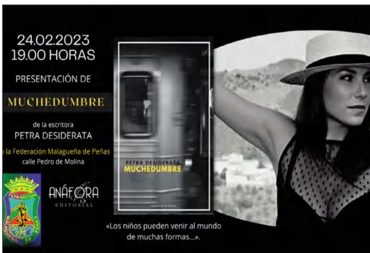
Cartel de la actividad.

De este modo, su salón de actos es cedido para la presentación de diversas obras literarias a editoriales como Anáfora, que este viernes 24 de febrero a las 19 horas acogerá la puesta de largo de 'Muchedumbre' de la escritora Petra Desiderata.