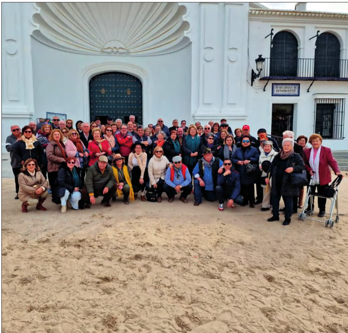
Imagen de grupo en el exterior de la Ermita de la Virgen del Rocío.