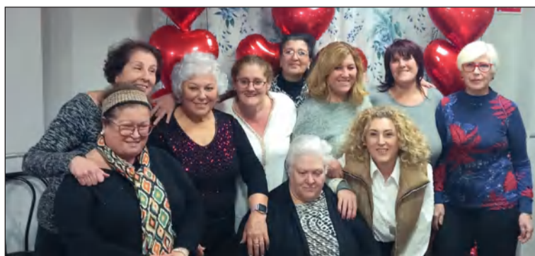
Señoras asistentes a la comida del Día de los Enamorados.

Ya en marzo, el día 5 habrá una comida en homenaje al Día de la Mujer; mientras que el sábado 25 será su XXVIII Torneo de Parchís.