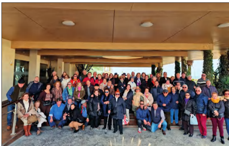
Peñistas en el exterior del hotel de Matalascañas.

elegido para esta actividad, la excursión resultó especialmente variado y emotivo. Además de la siempre importante visita a la Blanca Paloma en la Aldea del Rocío, los participantes también disfrutaron el Día de los Enamorados e incluso se vivieron momentos de risa en fechas carnavaleras.