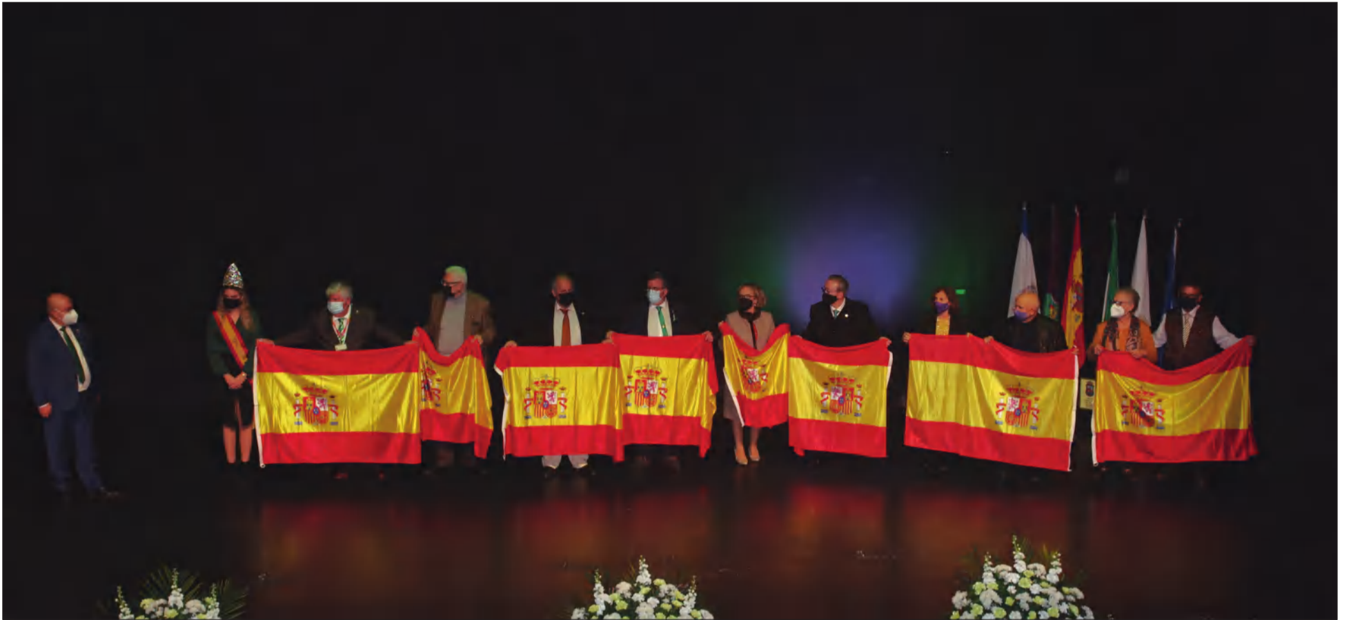
Entrega de las banderas correspondientes al Gobierno de España en la edición de 2022 del Día de Andalucía.

• FEDERACIÓN MALAGUEÑA DE PEÑAS, CENTROS CULTURALES Y CASAS REGIONALES 'LA ALCAZABA'