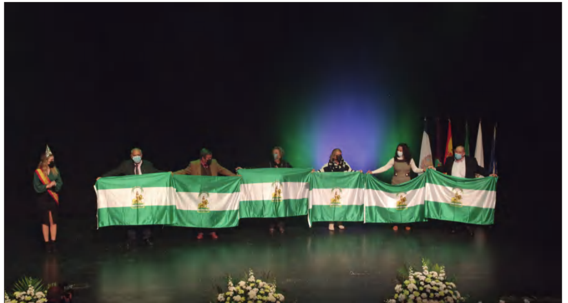
Entrega de banderas de Andalucía en el acto celebrado el 28 de febrero del pasado año.

Por eso, en este Día de Andalucía más que nunca, queremos invitarles a sentirnos orgullosos de lo que somos. De ser malagueños y andaluces, de lucir nuestra bandera como seña de nuestro pueblo.