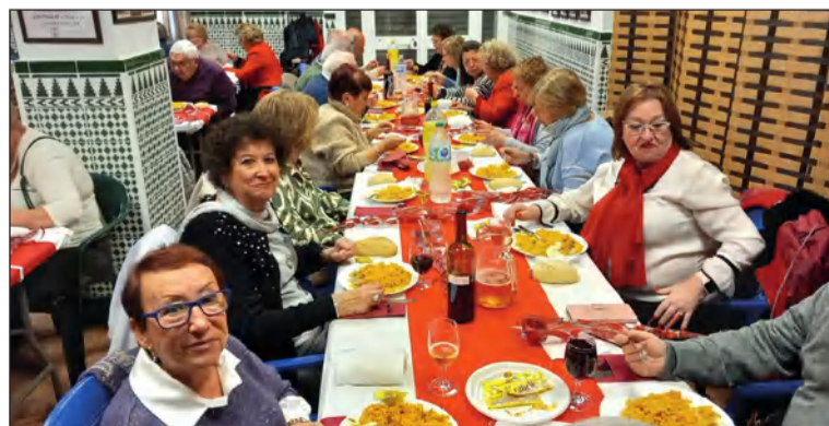
Socios disfrutando del almuerzo del Día de los Enamorados.

primero con un almuerzo y actuación musical en su sede, y posteriormente con un fin de semana en un hotel de Benalmádena.