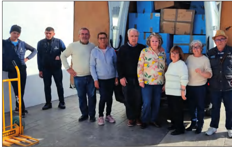
Voluntarios de Hanuca tras cargar el primer camión de ayuda a Siria y Turquía.

Por otra parte, el próximo domingo 26 de febrero se va a conmemorar junto a su sede en la calle La Sonata el Día de Andalucía. Desde las 12:30 se contará con pregón, himno y aperitivos.