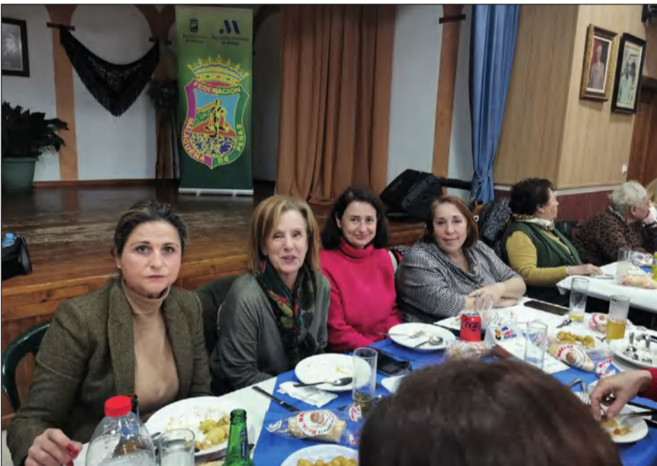
Representantes socialistas en la actividad.