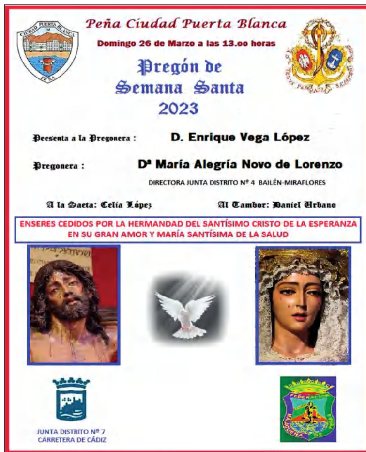
Cartel del Pregón de Semana Santa.

Y del Carnaval se pasará en unos días a la Semana Santa, de modo que ya se conoce el cartel de su Pregón previsto para el 26 del próximo mes.