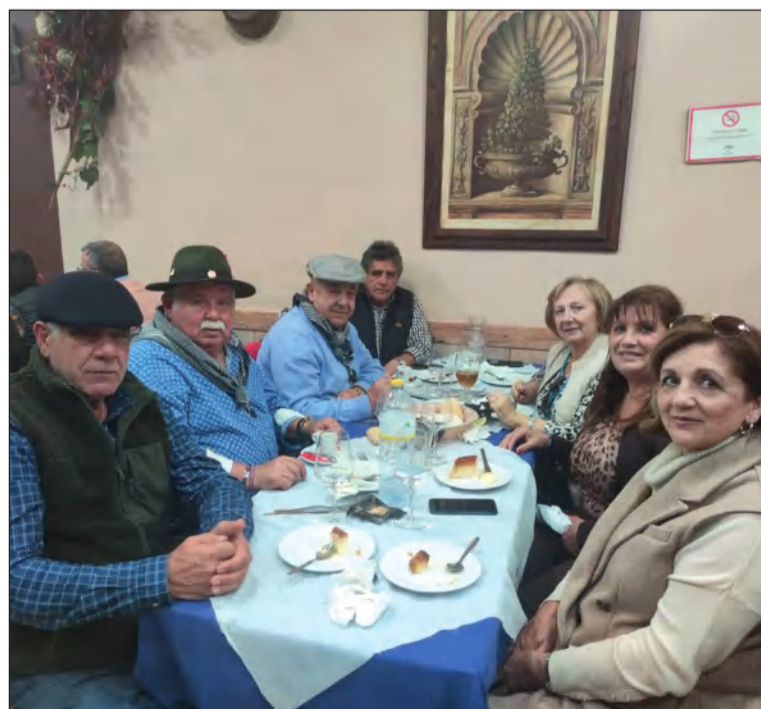
Almuerzo en Bodegas Roldán de Bollullos.