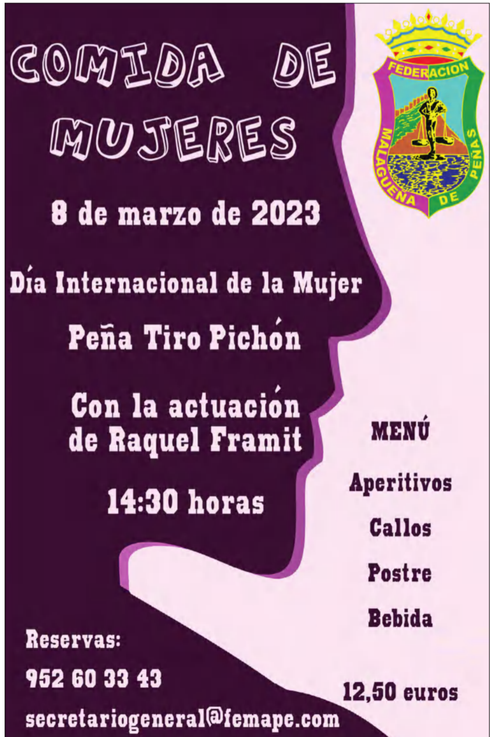
Cartel de la próxima Comida de Mujeres del 8 de marzo por el Día Internacional de la Mujer.