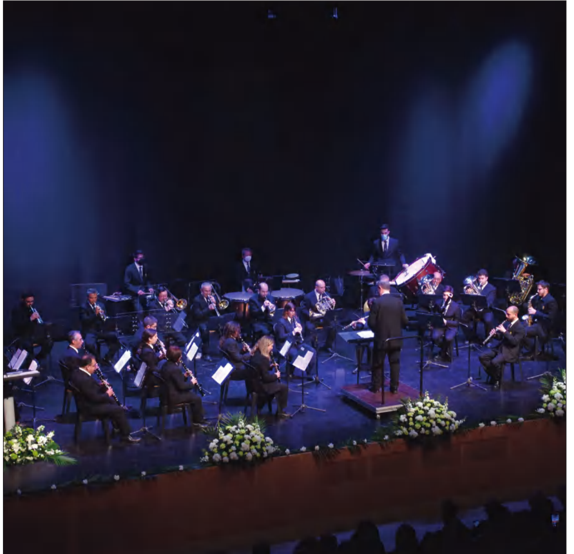
La Banda Municipal de Música de Málaga pondrá el broche de oro al acto.