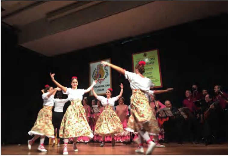
La Asociación Folclórico Cultural Solera.

• FEDERACIÓN MALAGUEÑA DE PEÑAS, CENTROS CULTURALES Y CASAS REGIONALES 'LA ALCAZABA'