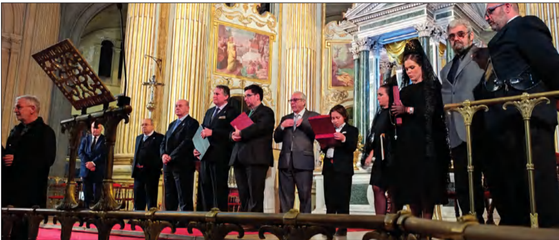
Participantes en el acto celebrado en la Santa Iglesia Catedral.

Tras las importantes obras de reforma ejecutadas en su sede, el pasado lunes 13 de febrero tenía lugar el acto de inauguración con un importante programa de actos desarrollado desde las 17 horas; con diversas actuaciones, entre ellas la de Salma, finalista del televisivo programa La Voz 2022.