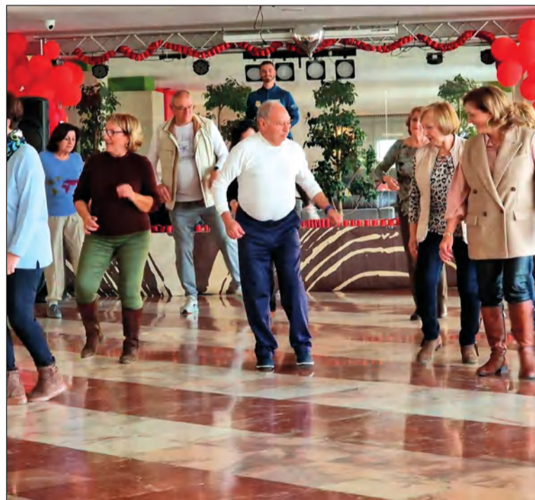
Actividades lúdicas en el hotel.