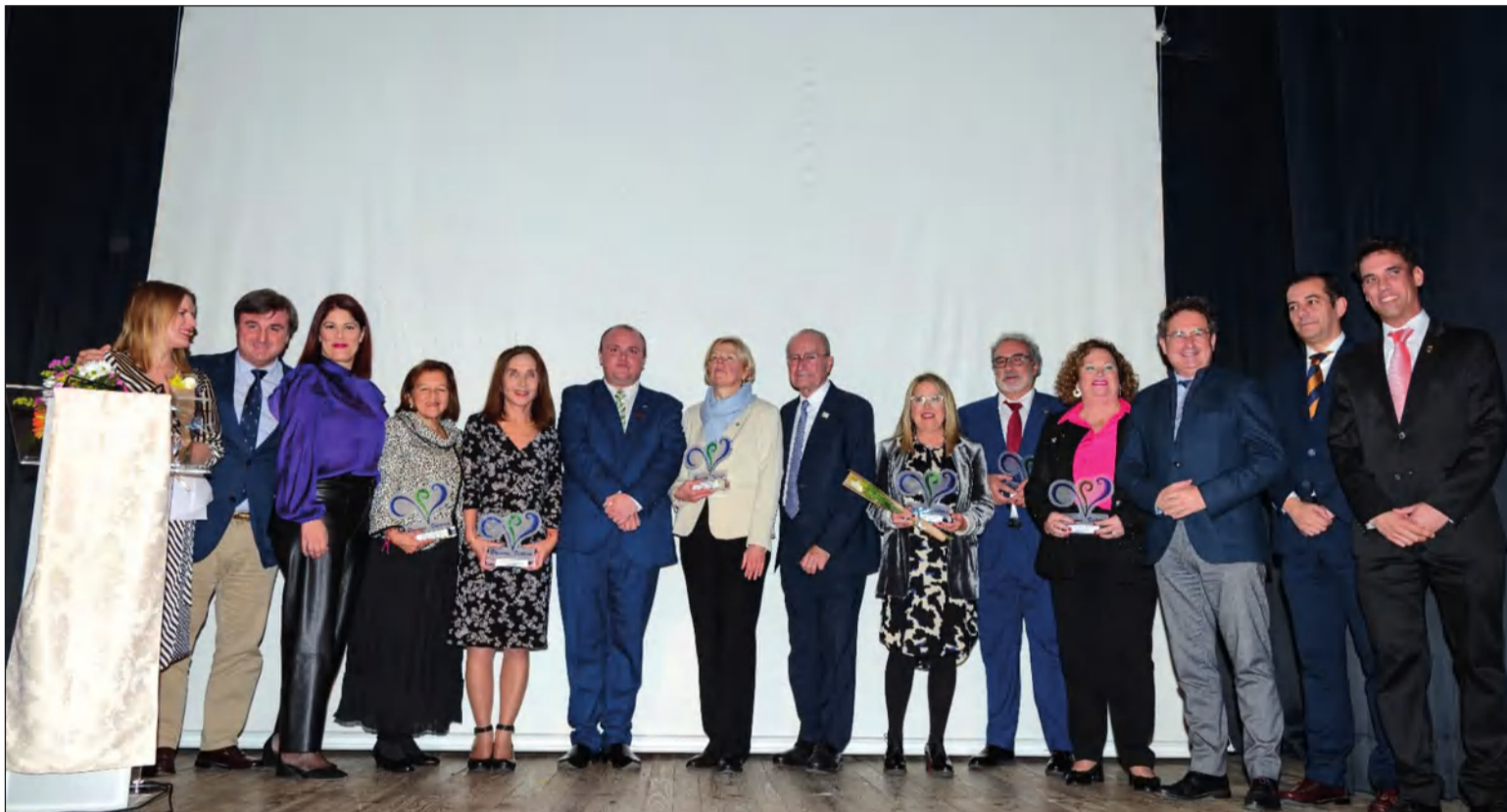
Galardonados junto a autoridades asistentes y miembros de la asociación.