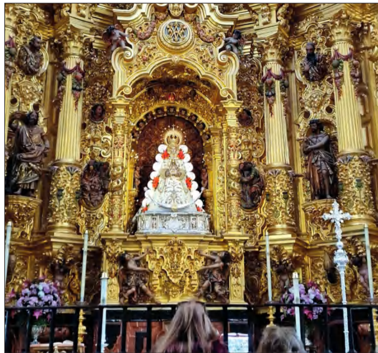
Visita a la Ermita del Rocío.