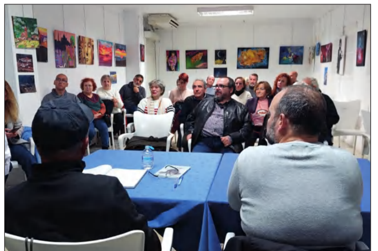
Presentación del certamen literario.

Este mismo lugar acogía el pasado 19 de febrero un Almuerzo de Carnaval.