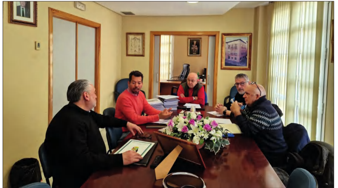
Participantes en la reunión mantenida en la sede de la Federación Malagueña de Peñas.

Constará de tres sesiones a desarrollar en el mes de abril; estando programado el día 11 con 'Estructura técnica y musical de la Malagueña de Fiesta y sus letras', para continuar los martes sucesivos con 'Su carácter y aire tradicional' y 'Su historia y su ubicación social'.