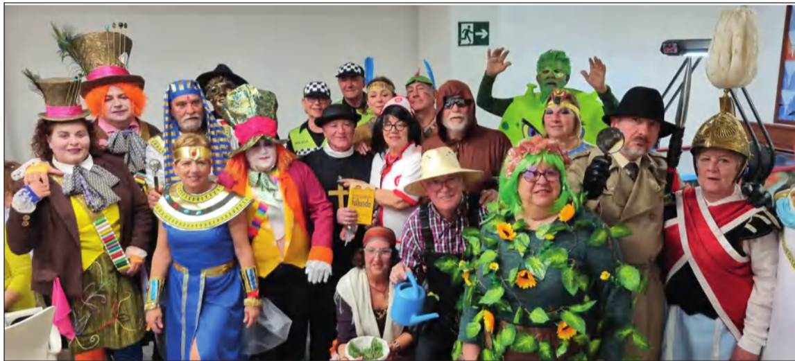
Los socios disfrutaron el Carnaval en esta actividad.