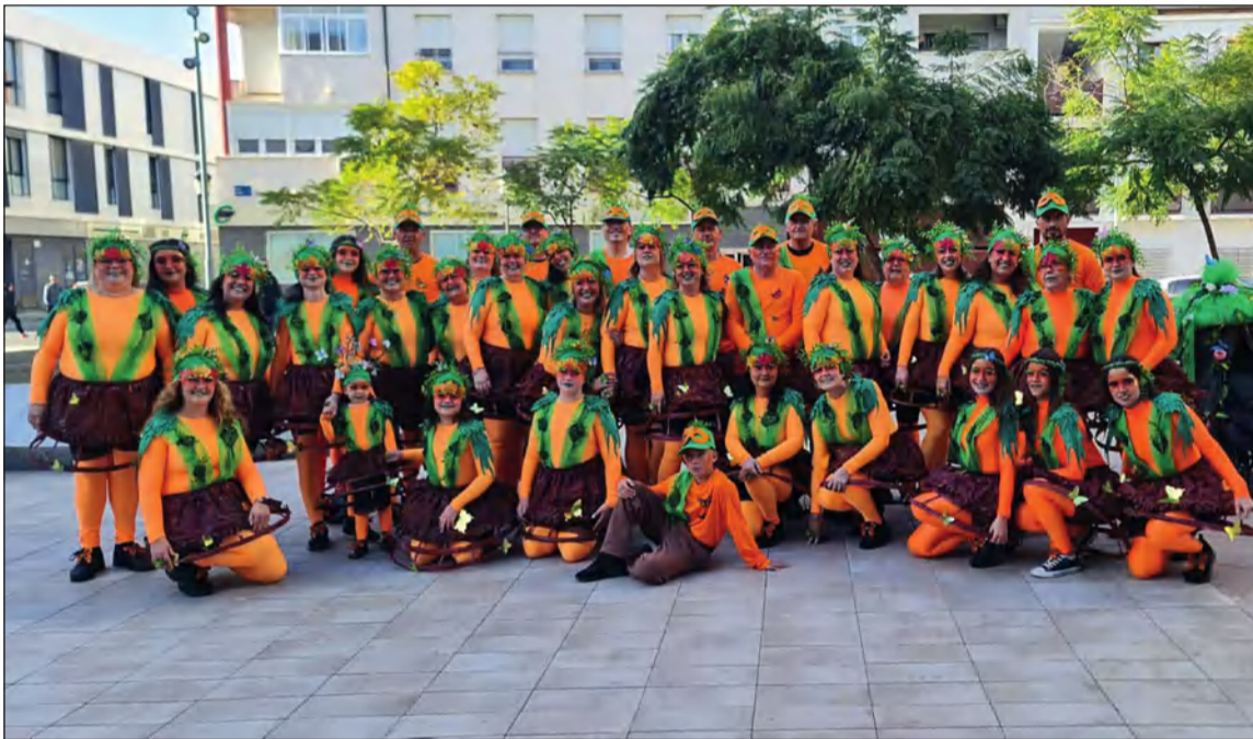
Integrantes del Grupo de Animación de la Peña Finca La Palma.

Además, participaban en el concurso organizado por la Fundación Ciudadana del Carnaval de Málaga, obteniendo el tercer premio.