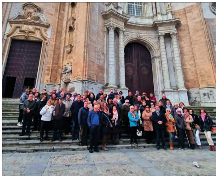
Socios de la entidad en el exterior de la Catedral de Cádiz.