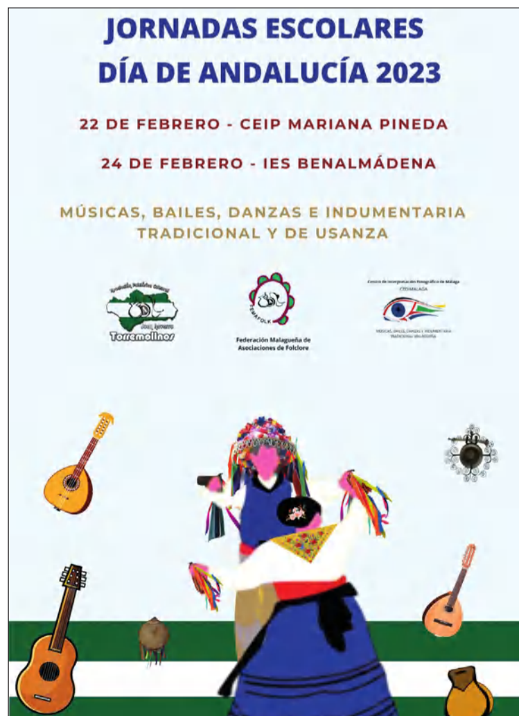
Cartel de la actividad.

El 22 de febrero acudirán al CEIP Mariana Pineda y el 24 de febrero al IES Benalmádena para presentar músicas, bailes, danzas e indumentaria tradicional y de usanza; acercando de este modo a los niños y los jóvenes estas señas de identidad de nuestra tierra.