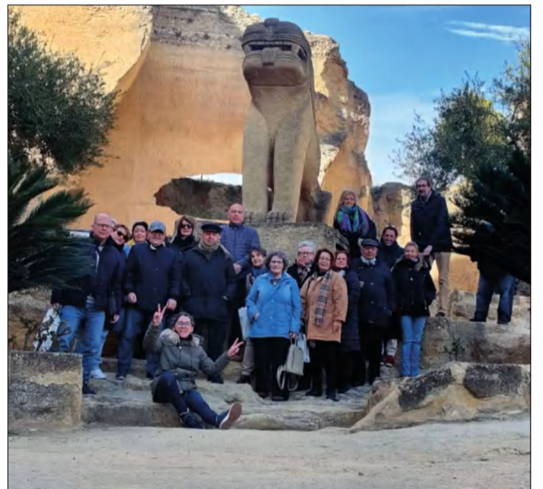
Imagen de grupo en la localidad de Osuna.

Un día después, un nutrido grupo de socios de la entidad participaban en una excursión cultural a la localidad sevillana de Osuna, donde pudieron disfrutar de su monumentalidad en una jornada de fortalecimiento de la hermandad entre sus componentes.