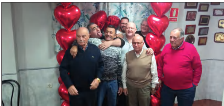
Divertida imagen de los hombres en esta actividad.