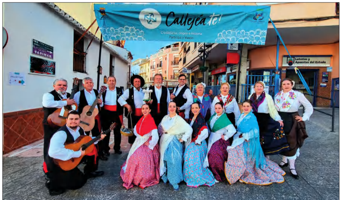
Integrantes de Raíces y Horizonte en su municipio de Alhaurín de la Torre.

en Alhaurín de la Torre, con una demostración de sus bailes y cantos además de sus indumentarias típicas malagueñas y andaluzas.