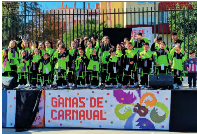
la murga infantil fue una de las participantes.

Se disfrutaba así de una gran jornada que deberá tener continuidad en las calles de Málaga.