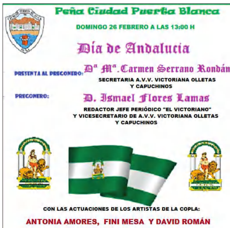
Detalle del cartel del acto del Día de Andalucía.

Ya de cara al mes de marzo, la entidad adelanta la celebración de una Fiesta de Carnaval el día 12.