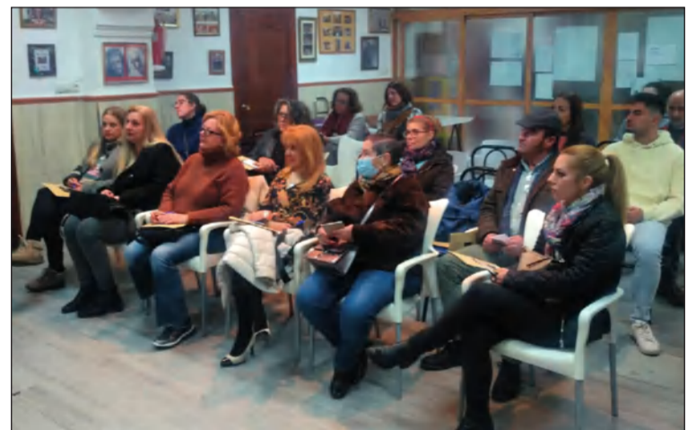
Asistentes a la charla de psicología de Núcleo Kaizen.

Por otra parte, la diversión llegaba a la sede en forma de fiesta de Carnaval. De este modo, los socios se daban cita el domingo 29 para degustar unos Callos Carnavalescos en una jornada muy divertida y que servía para reforzar la hermandad entre los componentes de esta peña.