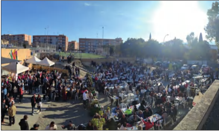
Gran participación en la actividad organizada por la Peña Los penosos.