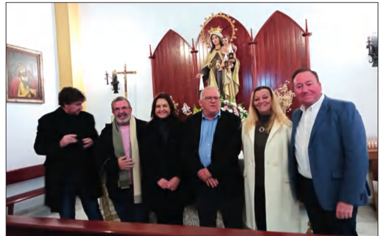
Componentes de la asociación en el interior del templo.

Por último, acudieron a la celebración de la Santa Misa que presidió el Señor Obispo de Málaga.