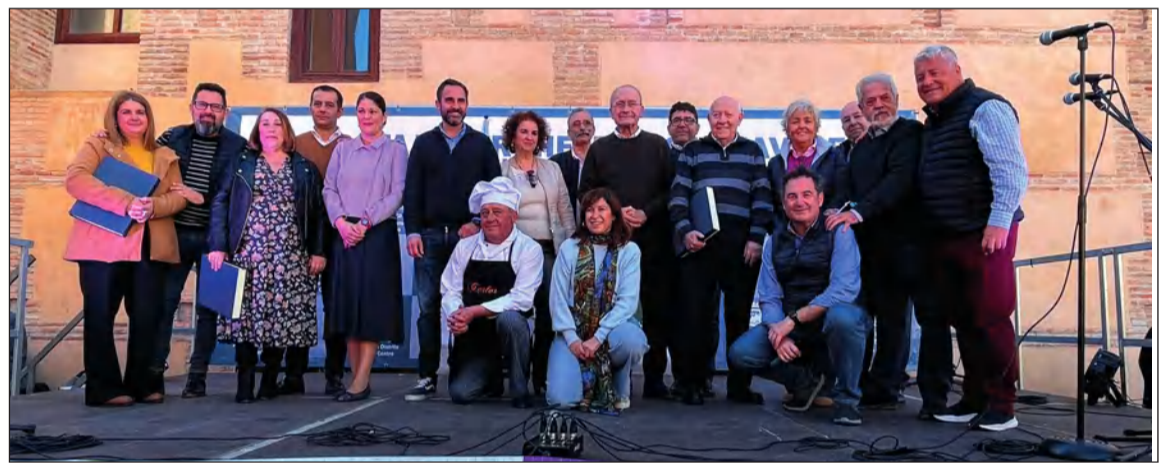
El Potaje Perchelero se celebraba el domingo 5 de febrero con gran participación.

• FEDERACIÓN MALAGUEÑA DE PEÑAS, CENTROS CULTURALES Y CASAS REGIONALES 'LA ALCAZABA'