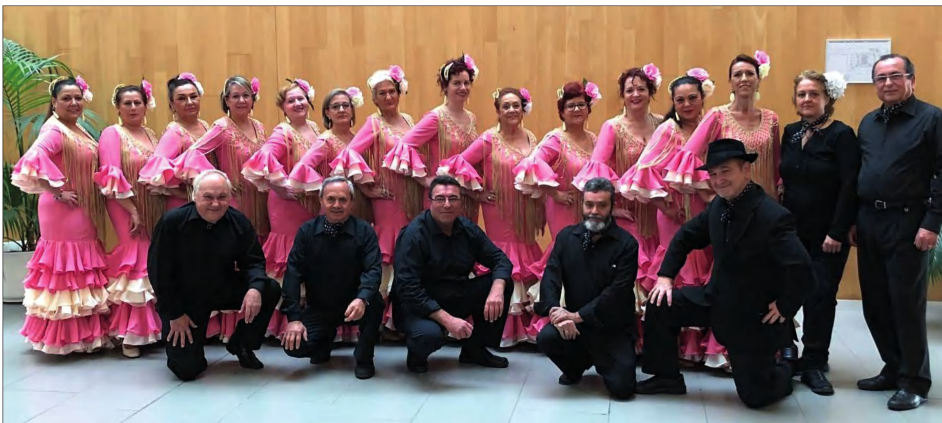
La Asociación Folclórico Cultural Solera regresa a este acto del Día de Andalucía tras su última participación en su edición de 2018.