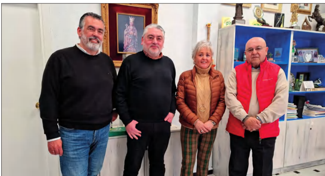
Los responsables del Área de Fiestas trabajan con la Federación en lograr avances en el tradicional certamen.