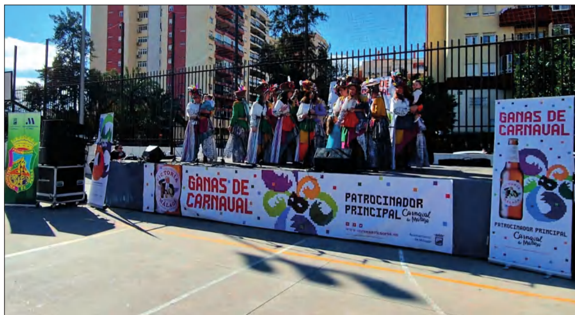
Berza Carnavalesca celebrada en las pistas deportivas de la calle Benjamin Franklin con participación peñista.

Por nuestra parte, no podemos más que animarles a vivir una Fiesta que es nuestra, porque Málaga es Carnavallera por los cuatro costados.