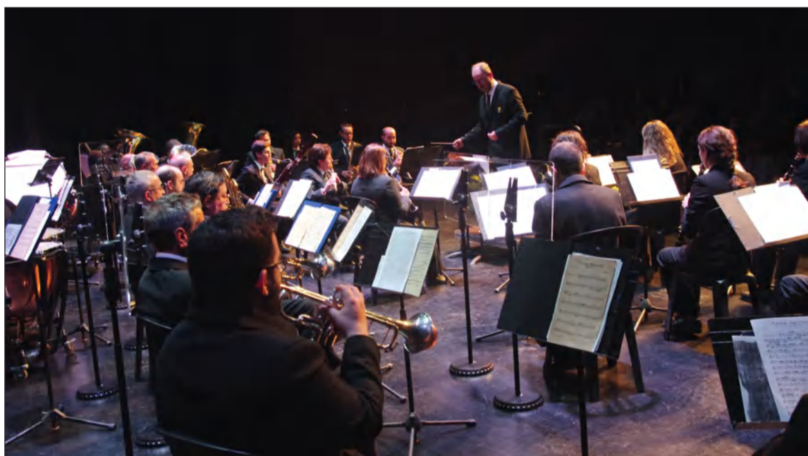
La Banda Municipal de Música de Málaga, en el Día de Andalucía 2023.