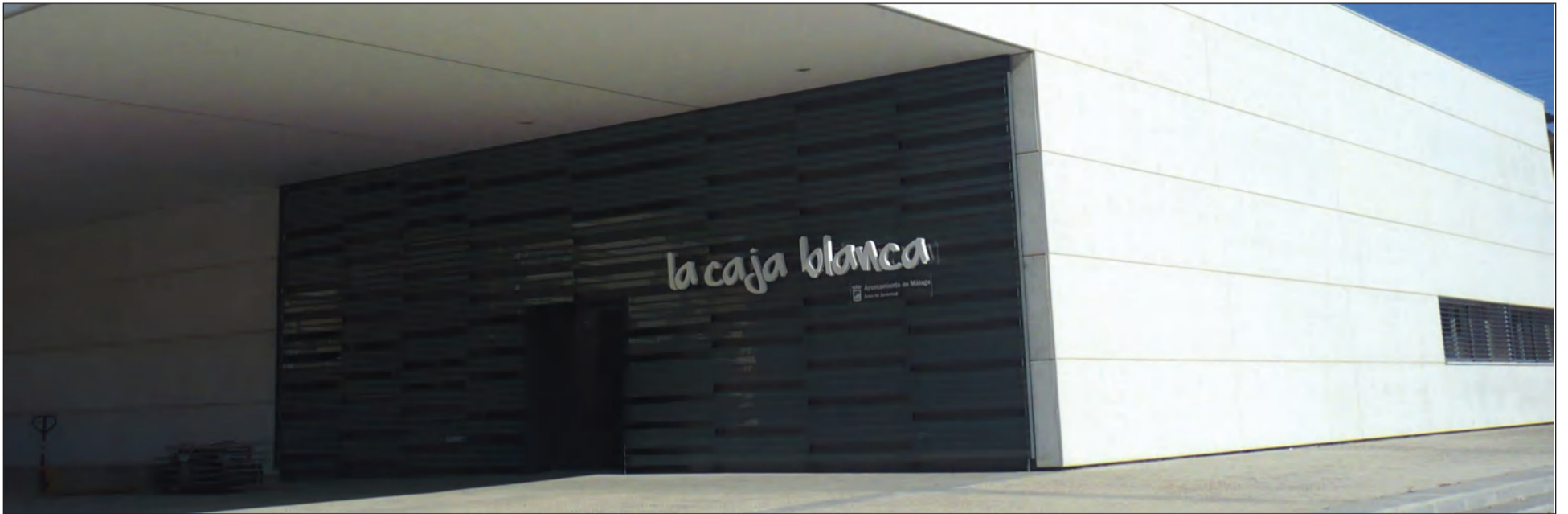
Vista exterior de la instalación donde se celebrará el Día de Andalucía 2023, ubicada en la Avenida Editor Ángel Caffarena, en el Distrito Teatinos.

• FEDERACIÓN MALAGUEÑA DE PEÑAS, CENTROS CULTURALES Y CASA REGIONALES 'LA ALCAZABA'