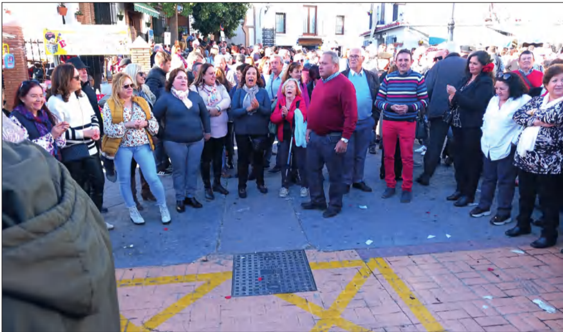
Socios de la Peña Perchelera en Comares.

ciente a la Federación Malagueña de Peñas se destaca el magnífico día que pasaron el pasado 14 de enero, agradeciendo al pueblo de Comares y a su alcalde la hospitalidad recibida.