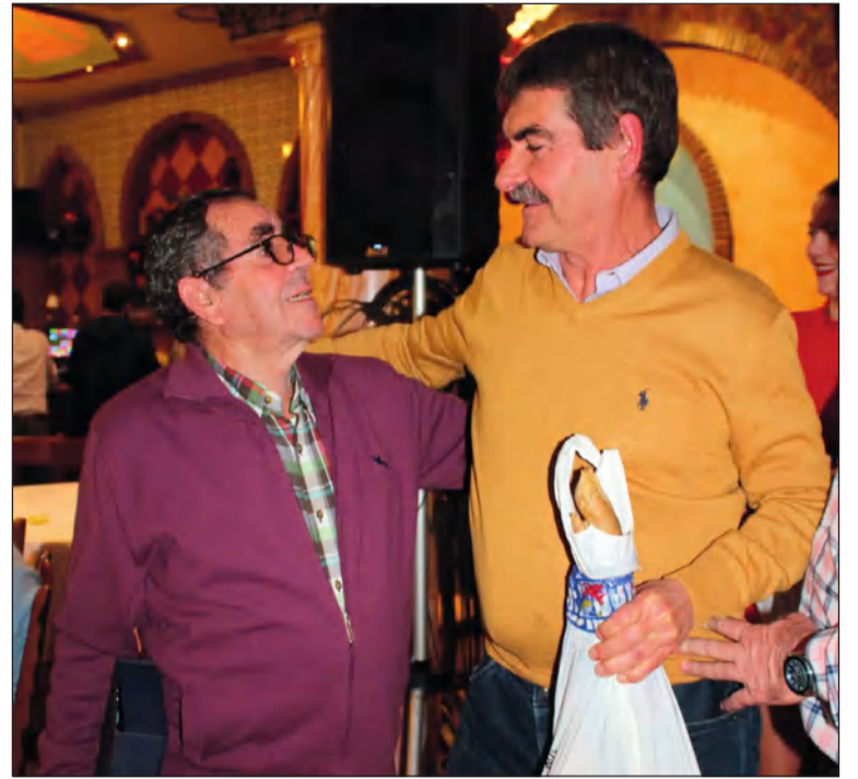
Campeones del maratón de dominó.