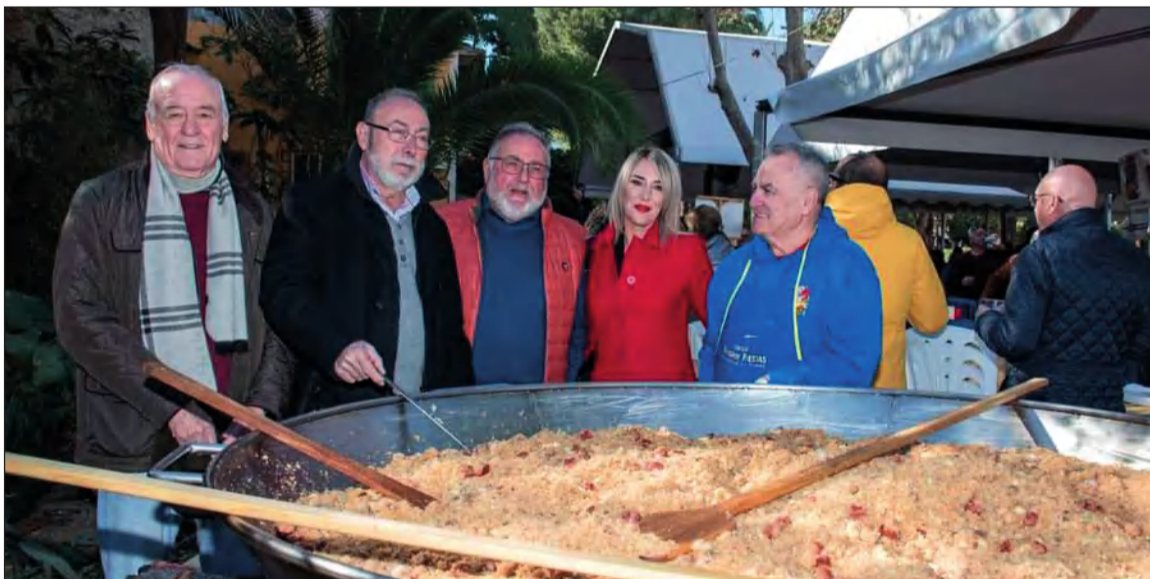
Los peñistas colaboraron en el reparto de las migas ofrecidas por el Ayuntamiento de Alhaurín de la Torre.