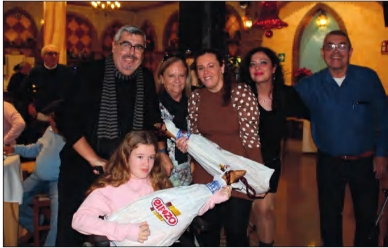
Socios de la entidad en el exterior del museo.

El acto concluía con baile a cargo del grupo Ritmo Andaluz, que puso el broche de oro a una jornada muy emotiva que era disfrutada por los socios y simpatizantes de esta entidad federada.