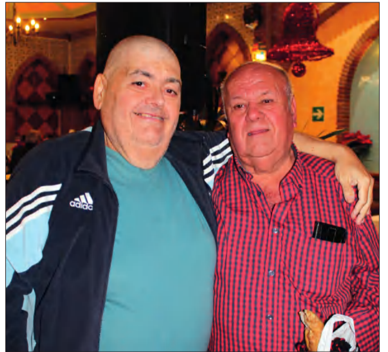
Entrega del premio al campeón de ranas.