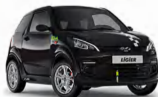
COCHES SIN CARNET

MÁLAGA Polígono San Luis | C/Carretería | C/Moraima | Av. Velázquez | C/María Tubau | Vélez-Málaga | Marbella | San Pedro de Alcántara