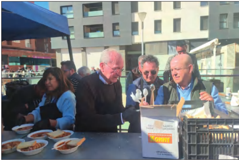
El alcalde Francisco de la Torre, junto al presidente peñista en El Perchel.

• FEDERACIÓN MALAGUEÑA DE PEÑAS, CENTROS CULTURALES Y CASAS REGIONALES 'LA ALCAZABA'