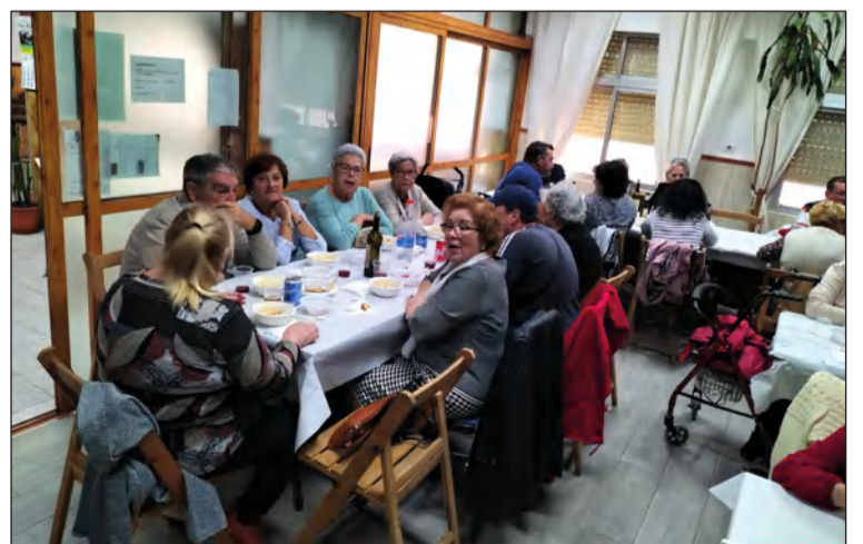
Vista del salón durante los Callos Carnavalescos.