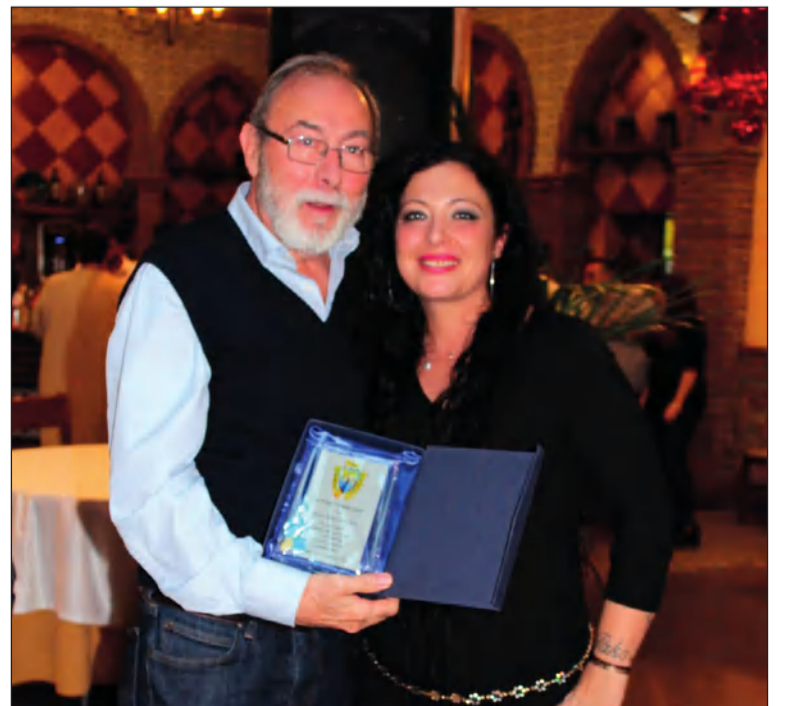
La nueva presidenta entrega un recuerdo al presidente de la Peña Perchelera.