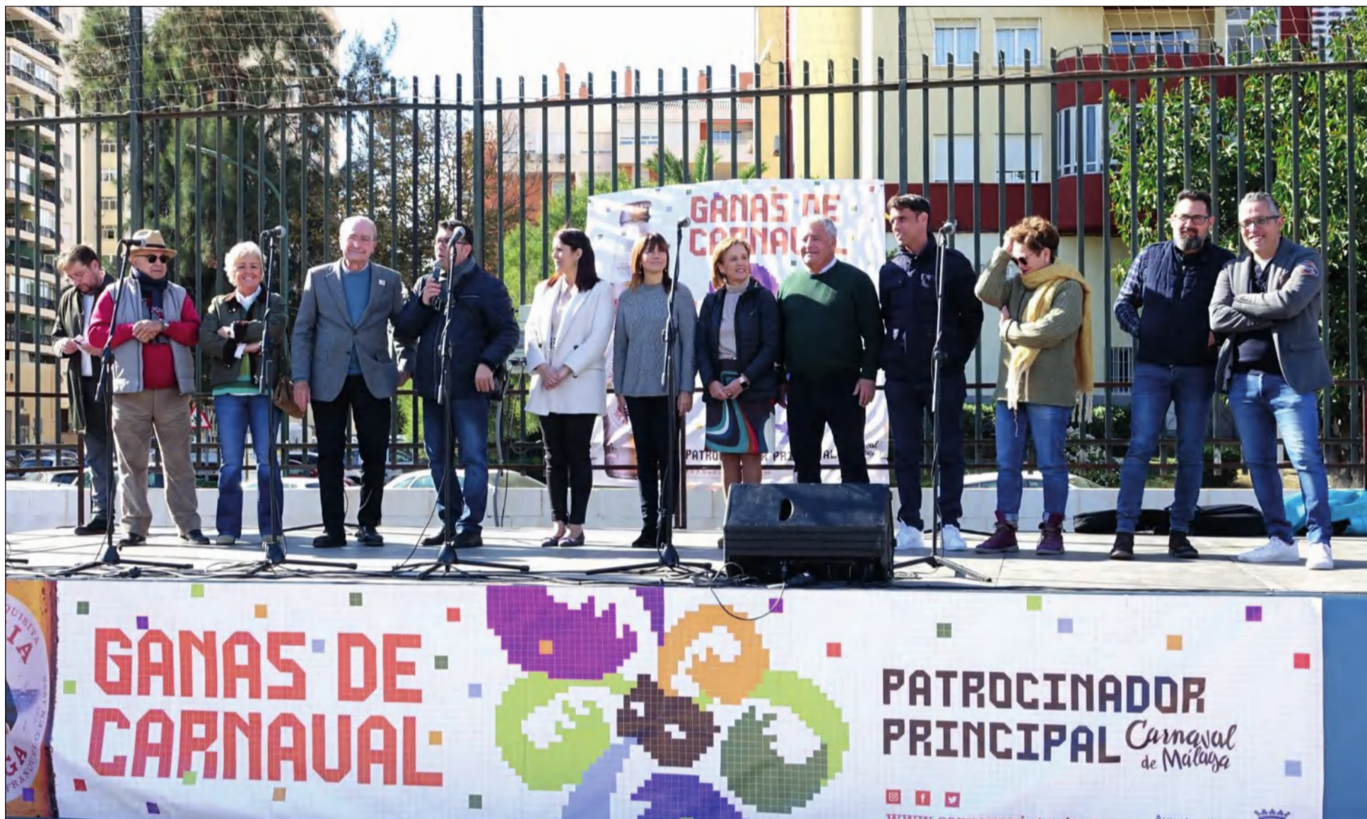
Las Berzas Carnavalescas contaron con un gran respaldo por parte de autoridades que no quisieron faltar a uno de los primeros eventos del Carnaval de Málaga 2023.

• FEDERACIÓN MALAGUEÑA DE PEÑAS, CENTROS CULTURALES Y CASAS REGIONALES 'LA ALCAZABA'