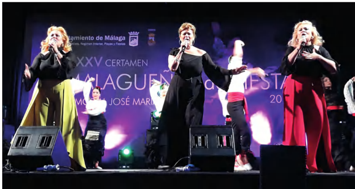
Las Hermanas Alarcón, en la final del Certamen de Malagueñas de Fiesta 2019.

También será la encargada de cerrar este acto con la interpretación de los himnos de Andalucía y España.