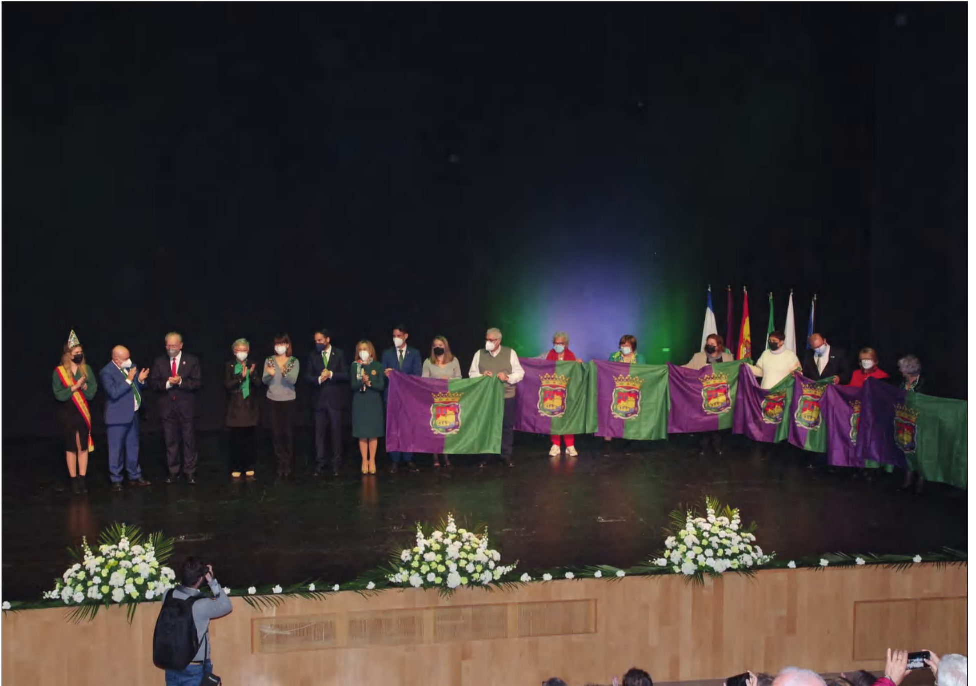
Entrega de las banderas correspondientes al Ayuntamiento de Málaga en la edición de 2022 del Día de Andalucía.

• FEDERACIÓN MALAGUEÑA DE PEÑAS, CENTROS CULTURALES Y CASAS REGIONALES 'LA ALCAZABA'