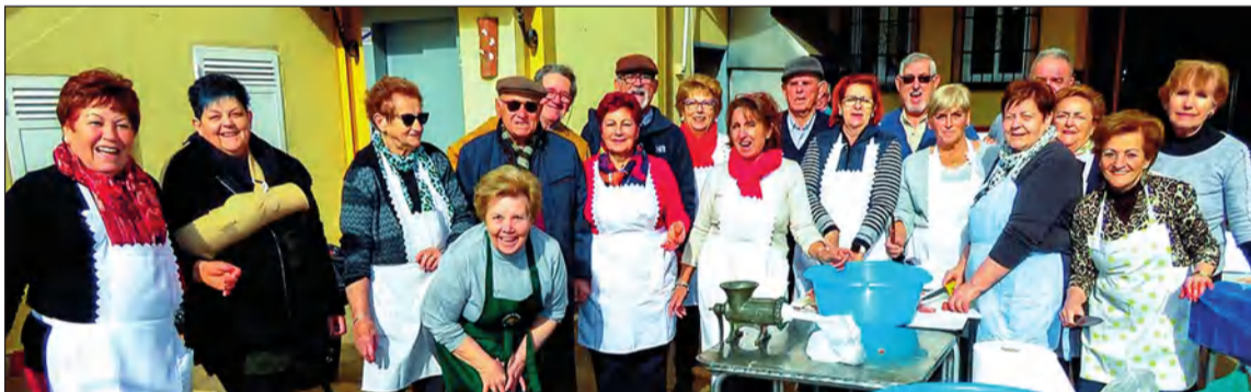
Socios disfrutando de la tradicional matanza.