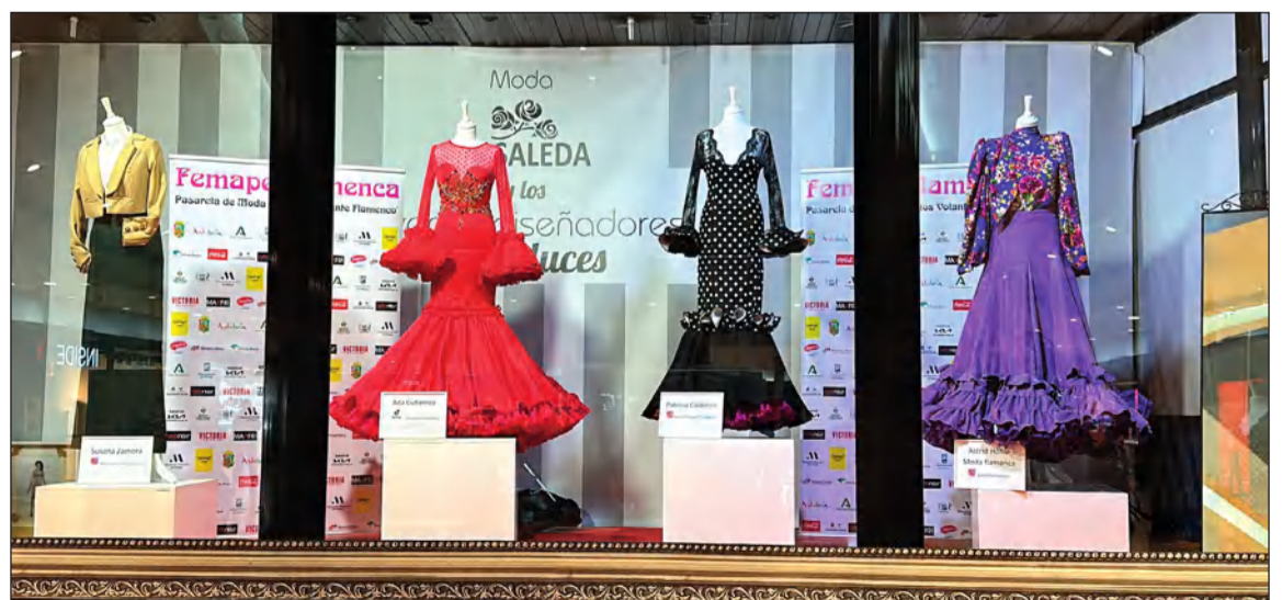
Expositor de FEMAPE Flamenca en el Centro Comercial Rosaleda.