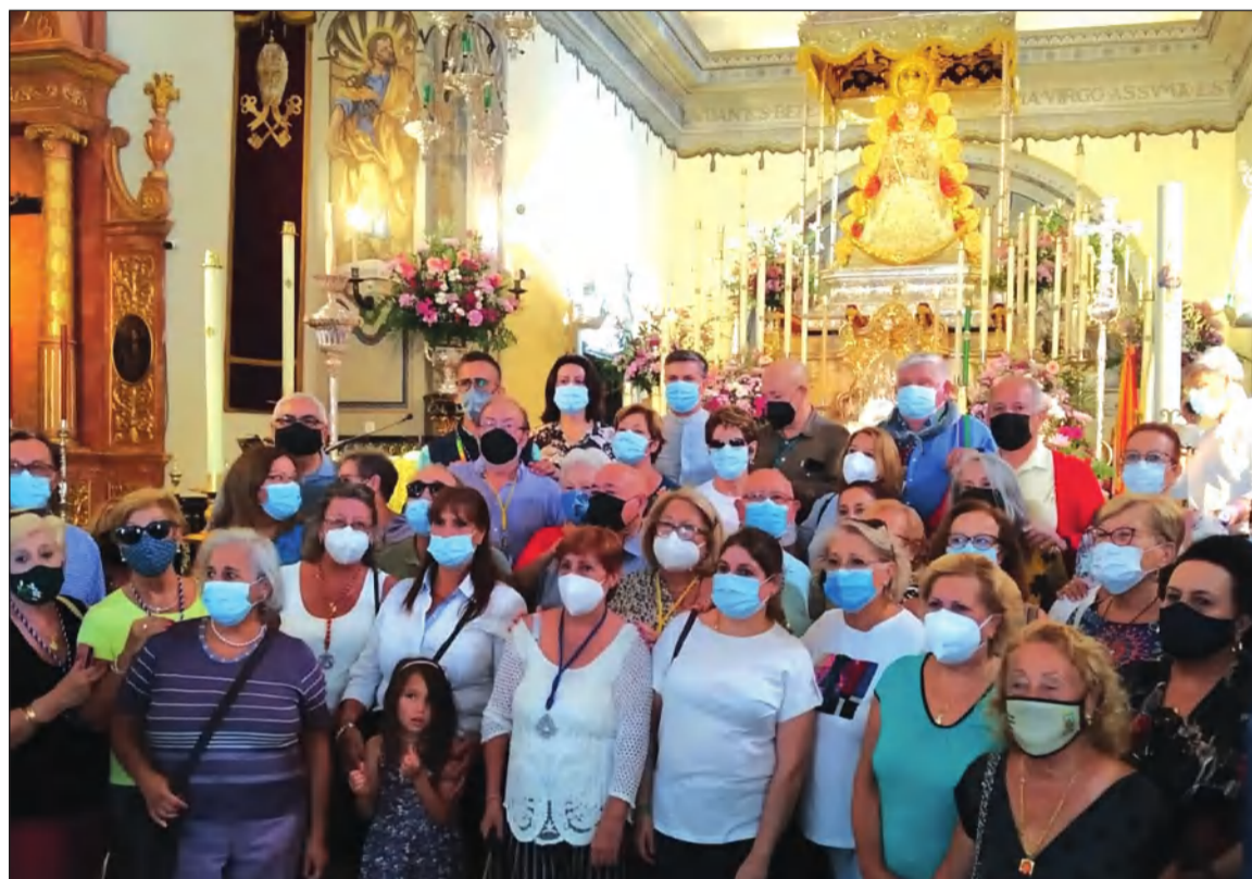
Miembros de entidades federadas ante la Virgen del Rocío en su visita a Almonte de 2021.