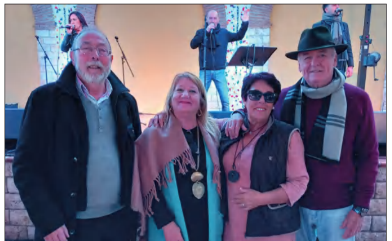
Con la presidenta de la Asociación Foro Cultural Raíces y Horizonte.