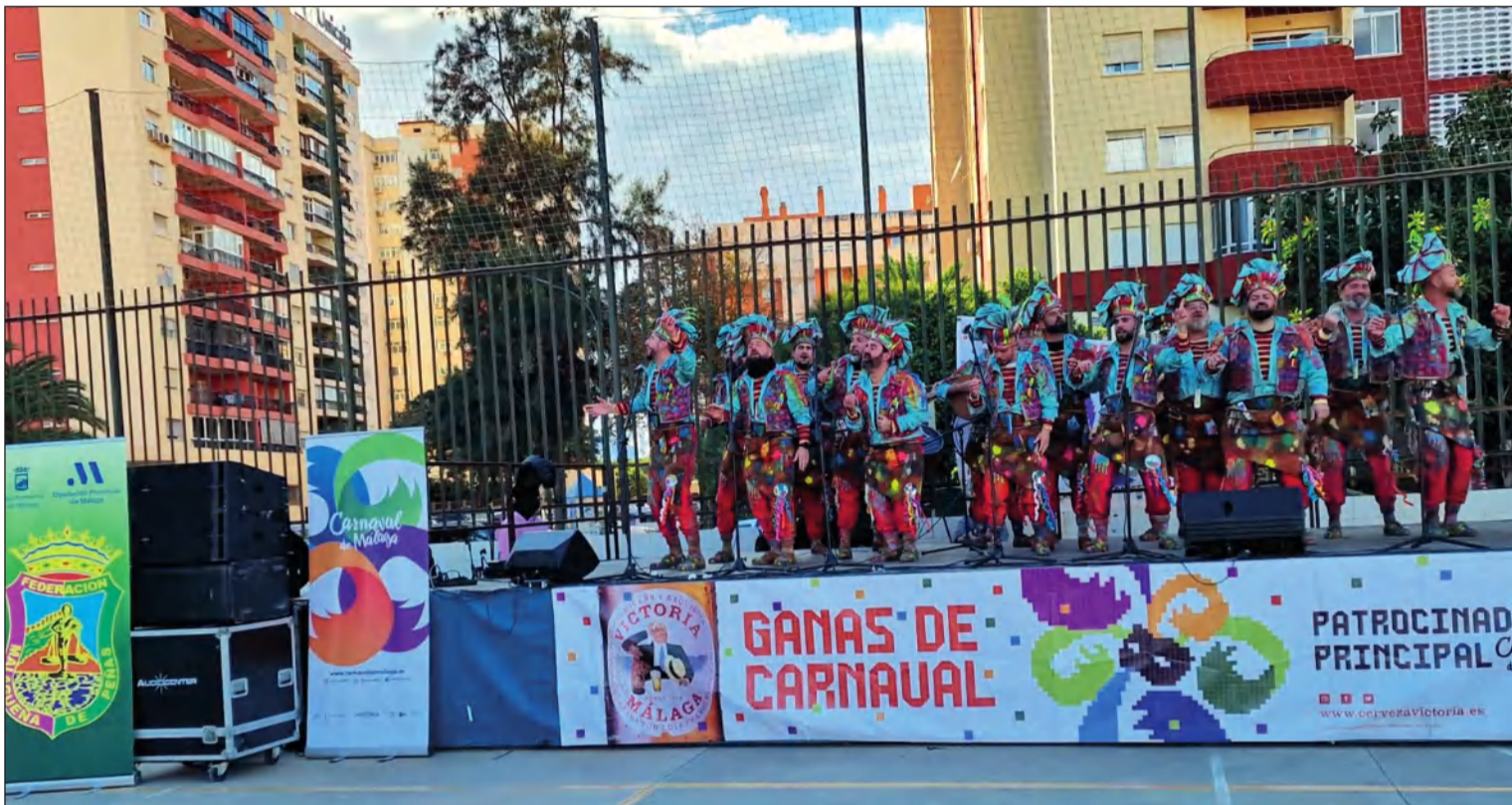
La Federación Malagueña de Peñas colaboraba en la organización de las Berzas Carnavalescas junto a la Peña Santa Cristina y la Peña Tiro Pichón.

Web: www.femape.com Edición digital: www.femape.com/laalcazabadigital Twitter: @FMPLaAlcazaba Facebook: FMPLaAlcazaba