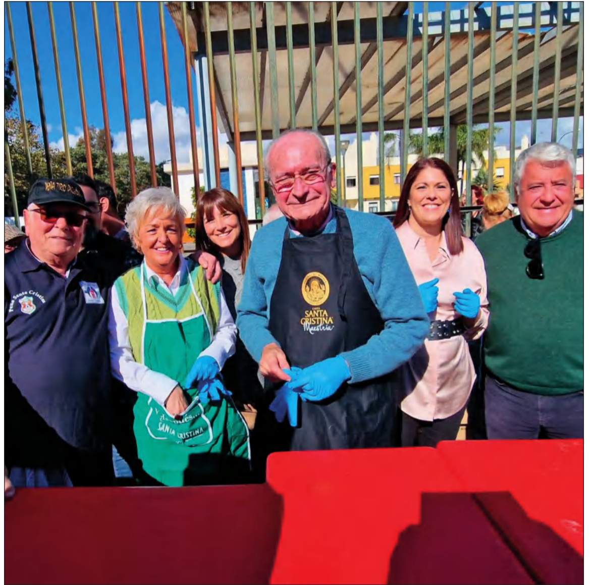
El alcalde y otros miembros de la corporación municipal colaboraron en el reparto de las berzas.