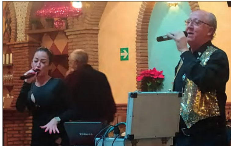
El grupo Ritmo Andaluz amenizó el acto.