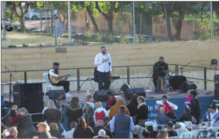
Una de las actuaciones que se sucedieron durante la jornada.