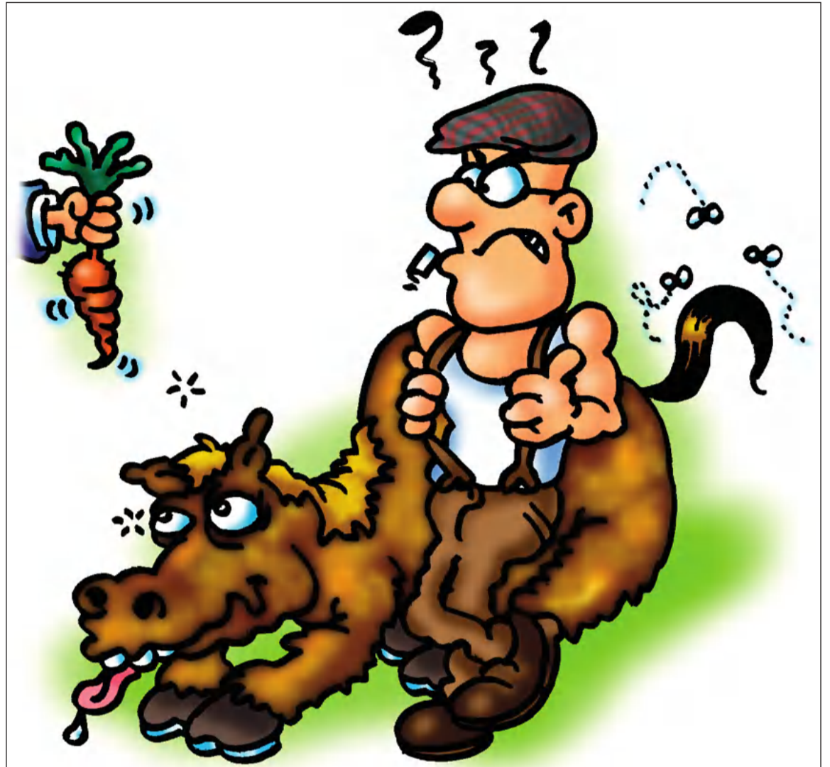
Ilustración de Enrique García.