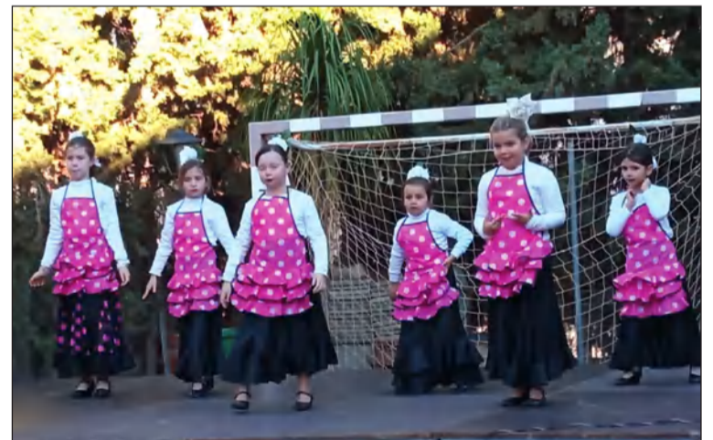
Uno de los grupos de Hanuca en esta conmemoración.