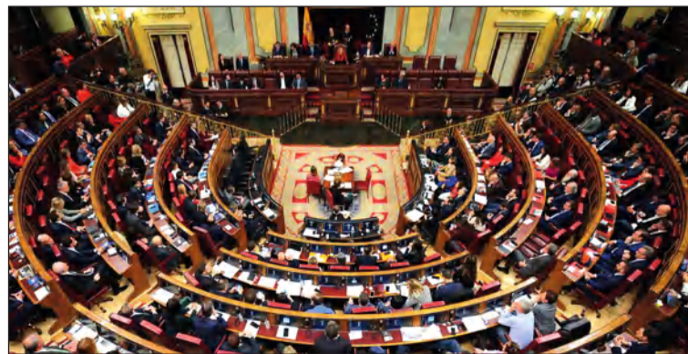
Imagen del Congreso de los Diputados.