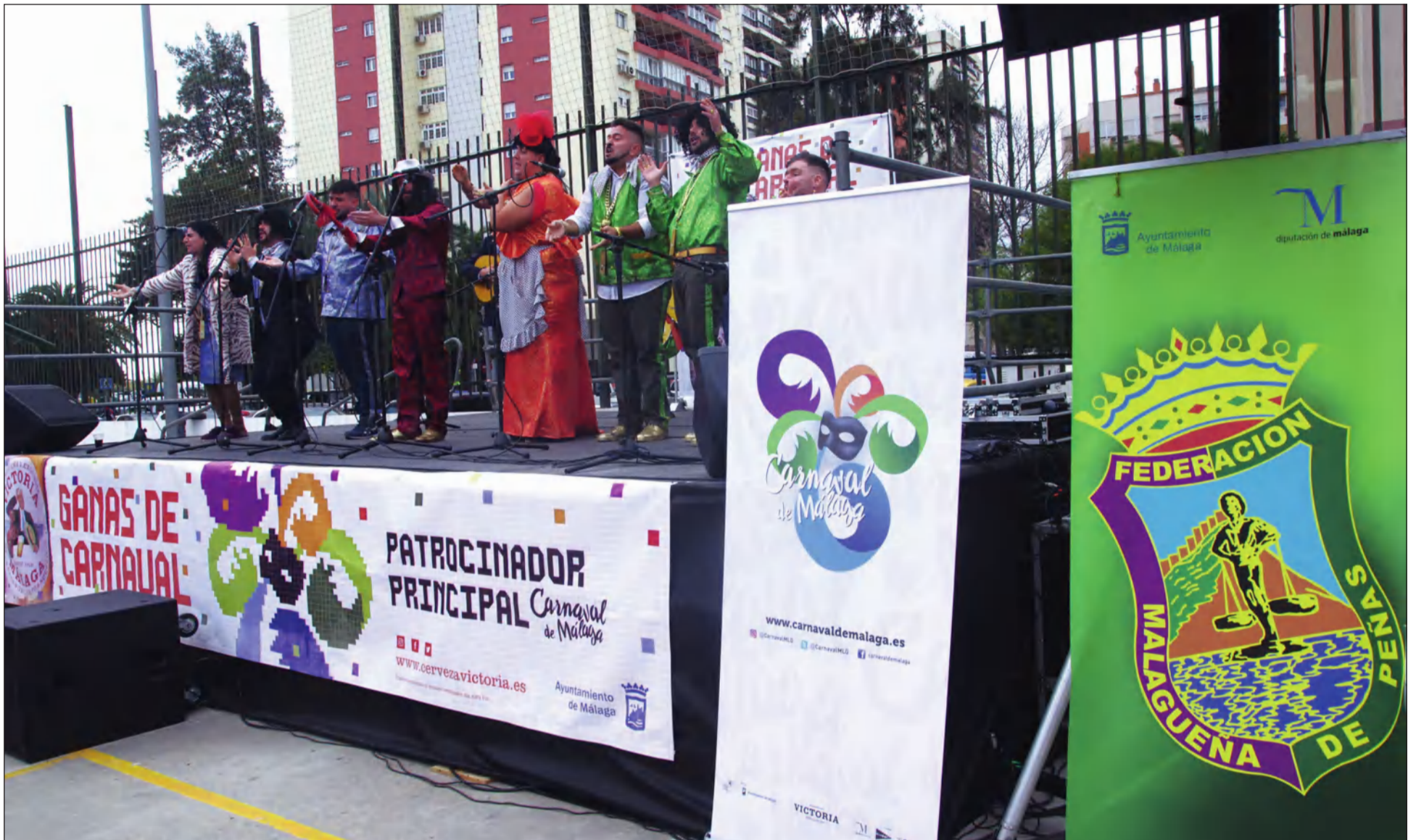
Edición de 2022 de las Berzas Carnavalescas que se organizan en el Distrito Cruz de Humilladero con la participación de la Federación Malagueña de Peñas.

• FEDERACIÓN MALAGUEÑA DE PEÑAS, CENTROS CULTURALES Y CASAS REGIONALES 'LA ALCAZABA'