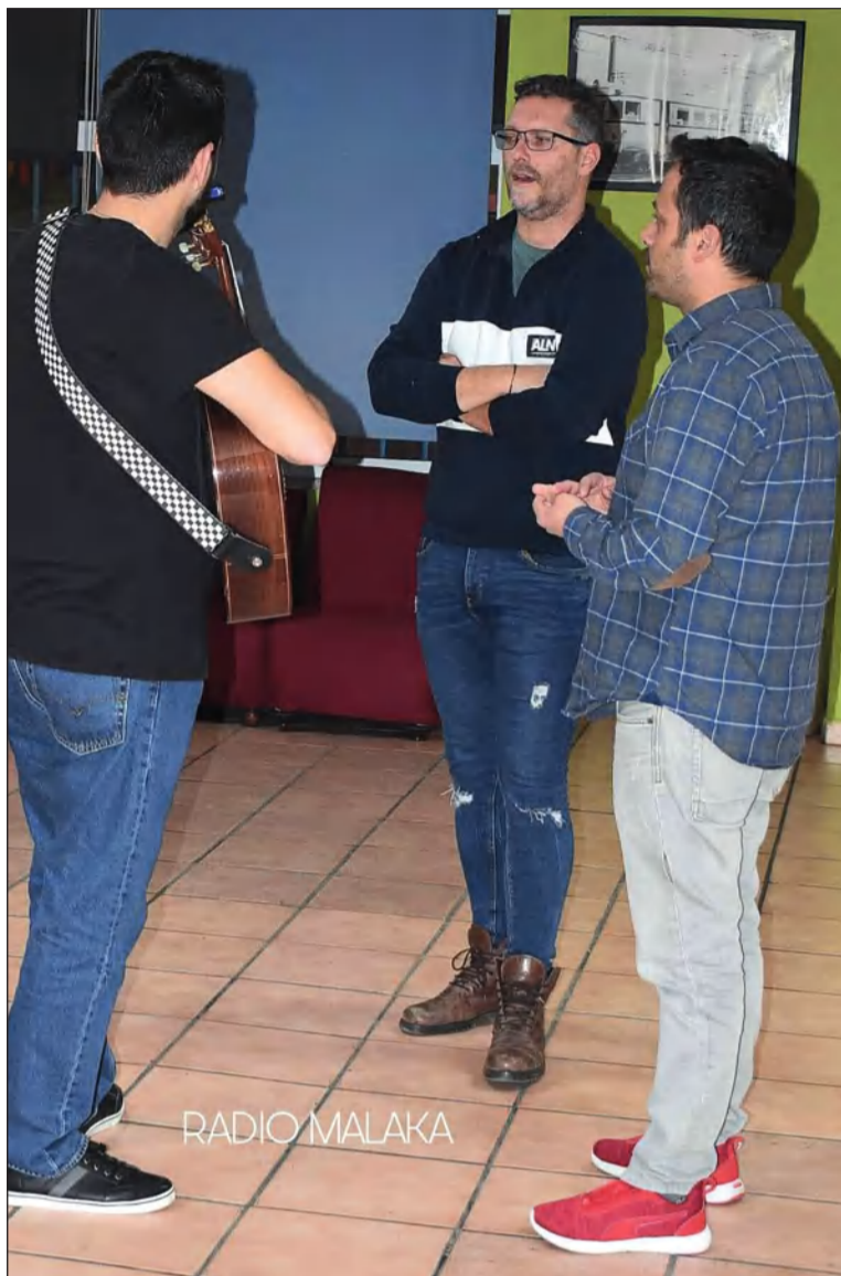
Uno de los ensayos en la sede del Centro Cultural Renfe.

minar del Concurso Oficial de Agrupaciones de Canto (COAC) 2023; por lo que desde la entidad le han querido transmitir sus mejores deseos para que tengan una gran participación en estas fiestas.