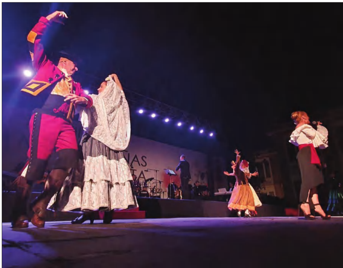
Imagen de archivo de la final del pasado Certamen de Malagueñas de Fiesta.

La organización trabaja en cerrar los lugares de celebración de cada una de las jornadas de trabajo, contándose con la colaboración de diversas cofradías y hermandades malagueñas.