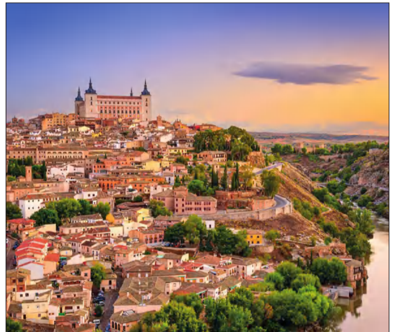
Toledo acogerá la asamblea anual de las Casas de Melilla en toda España.

En esta ciudad se va a celebrar del 14 al 17 de ese mes la Asamblea anual de la Federación Nacional de Casas de Melilla. El viaje lo harán en tren AVE hasta Madrid y allí enlazarán con otro tren de media distancia hasta Toledo.