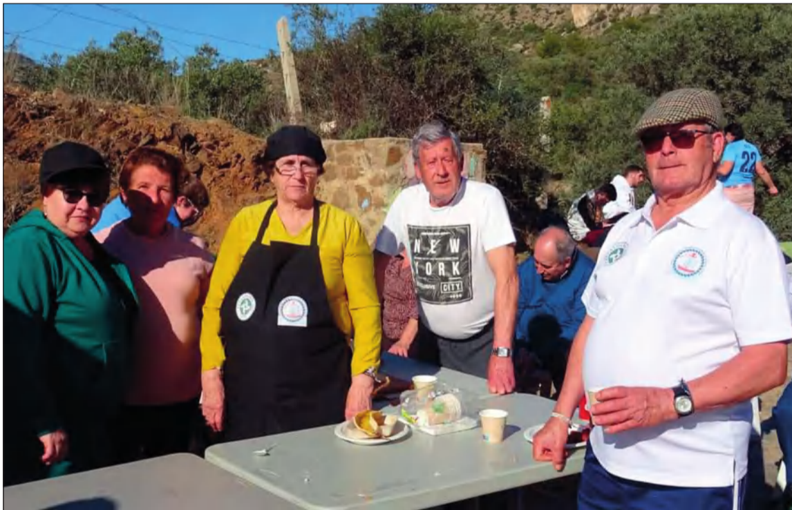
Socios de la Peña Los Bolaos en el Parque Lagarillo Blanco durante la Romería de San Antón 2023.

En este año, dentro del programa de actividades, tenían lugar las nuevas ediciones del Torneo de Petanca, el Concurso del Juego de la Rana y el Encuentro de Maragatas, continuando la buena acogida obtenida en años anteriores. Asimismo, se preparaban unas migas populares entre todas las entidades del barrio.