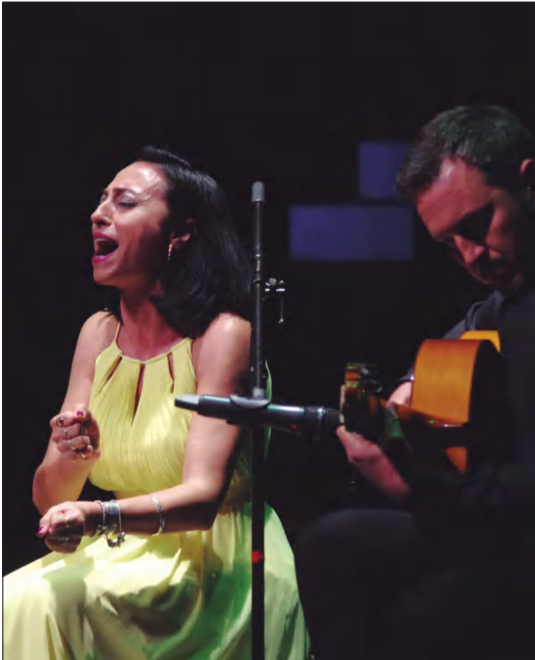
El acto contará con actuaciones musicales, como la de La Morena en 2022.

con la presencia de las autoridades, cerrándose el acto con un recital de temas andaluces a cargo de la Banda Municipal de Música de Málaga, que será igualmente la encargada de interpretar los Himnos de Andalucía y España para cerrar el acto conmemorativo de este 28 de febrero..