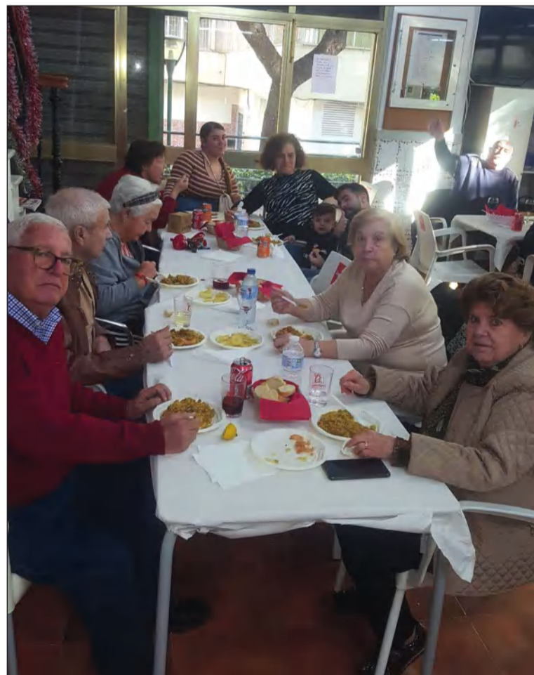
Algunos de los socios asistentes a esta actividad.