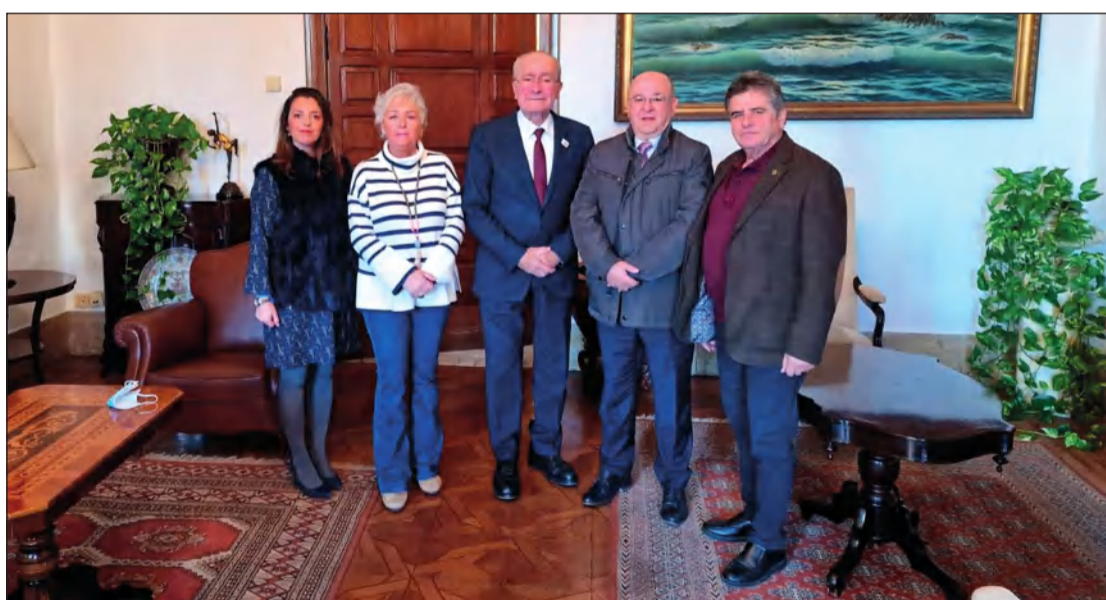
Reunión mantenida este lunes con el primer edil de la ciudad para abordar diversos proyectos del colectivo.