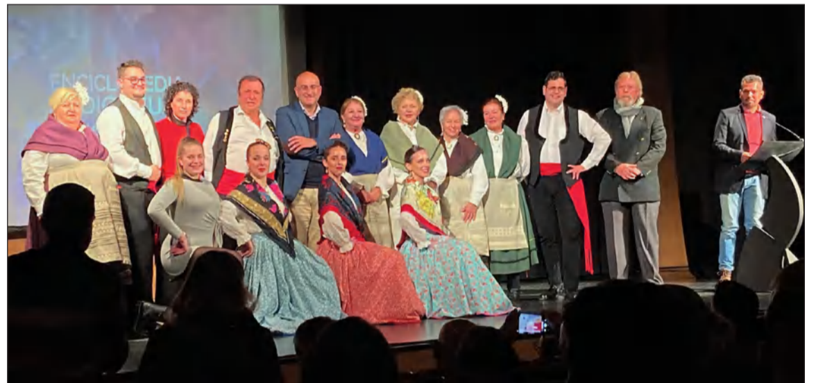
Acto de presentación en el Centro Cultural MVA, que contó con la asistencia del presidente de la Federación de Peñas.

El Morche; el Coro Parroquial de la Iglesia Parroquial de Santa Ana de Alfarnate; la Pastoral de Ardales; la Asociación Cultural Fandango de Cómpeta; vecinas de Genalguacil; vecinas de Mijas; la Asociación Foro cultural Raíces y Horizonte; la Asociación Cultural de Folclore y Tradiciones Andaluzas de Marbella, y la Asociación Cultural Alifara.