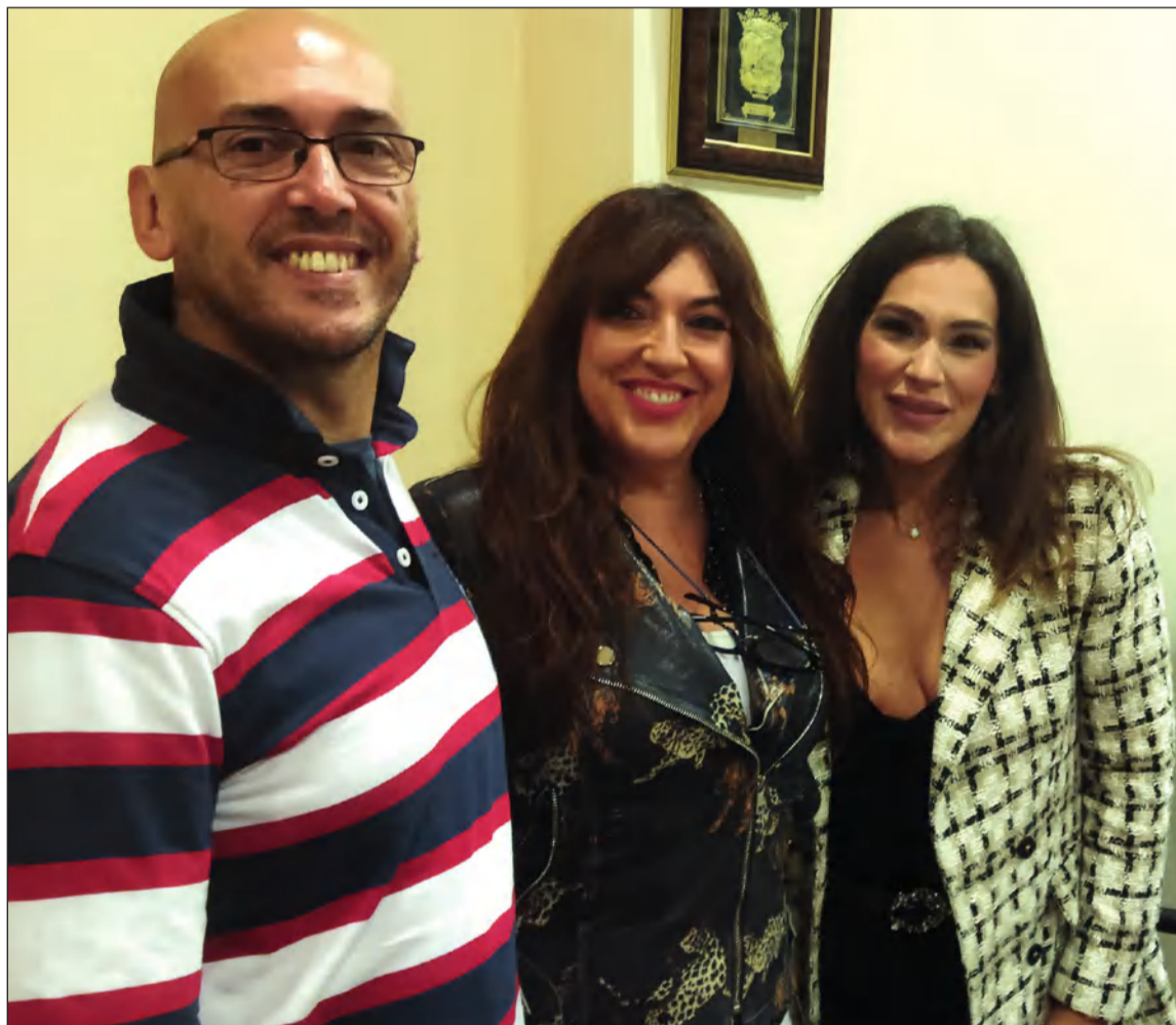
La obra ha sido editada por Anáfora.