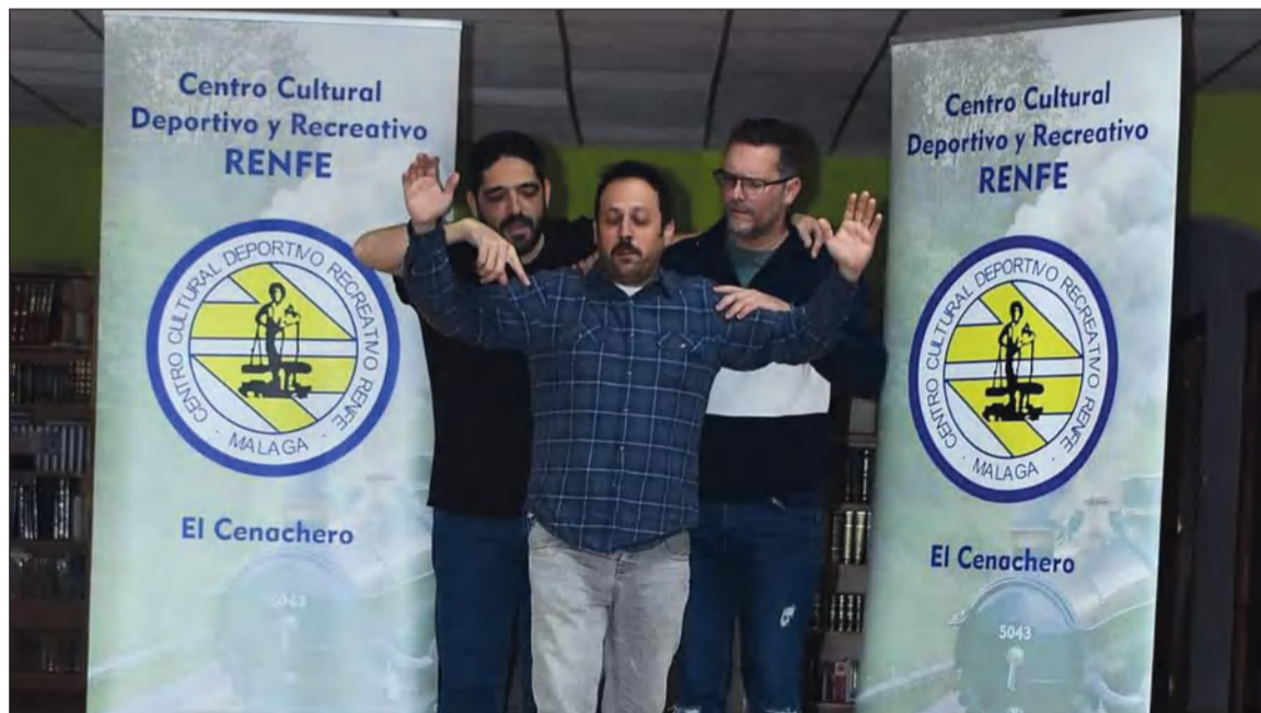
Integrantes del cuarteto.