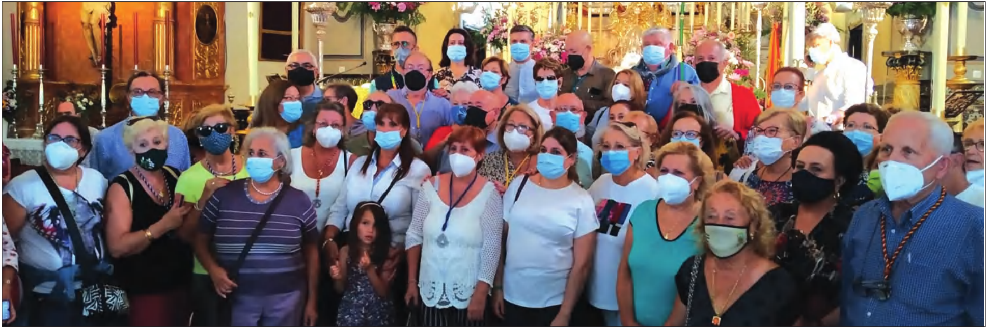
Grupo que peregrinó a El Rocío en octubre de 2021.

• FEDERACIÓN MALAGUEÑA DE PEÑAS, CENTROS CULTURALES Y CASAS REGIONALES 'LA ALCAZABA'