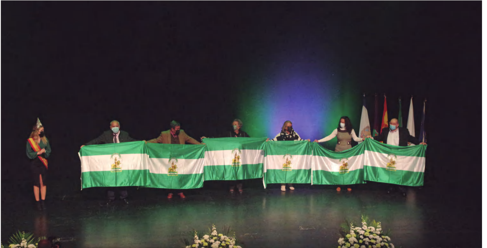
Entrega de banderas en la edición de 2022 del Día de Andalucía.

• FEDERACIÓN MALAGUEÑA DE PEÑAS, CENTROS CULTURALES Y CASAS REGIONALES 'LA ALCAZABA'