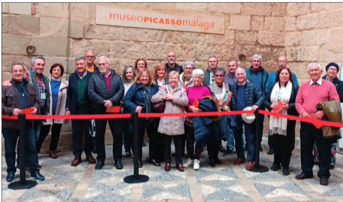
Socios de la entidad en el exterior del museo.

El Museo Picasso Málaga está situado en el Palacio de Buenavista, en pleno casco histórico de la ciudad.