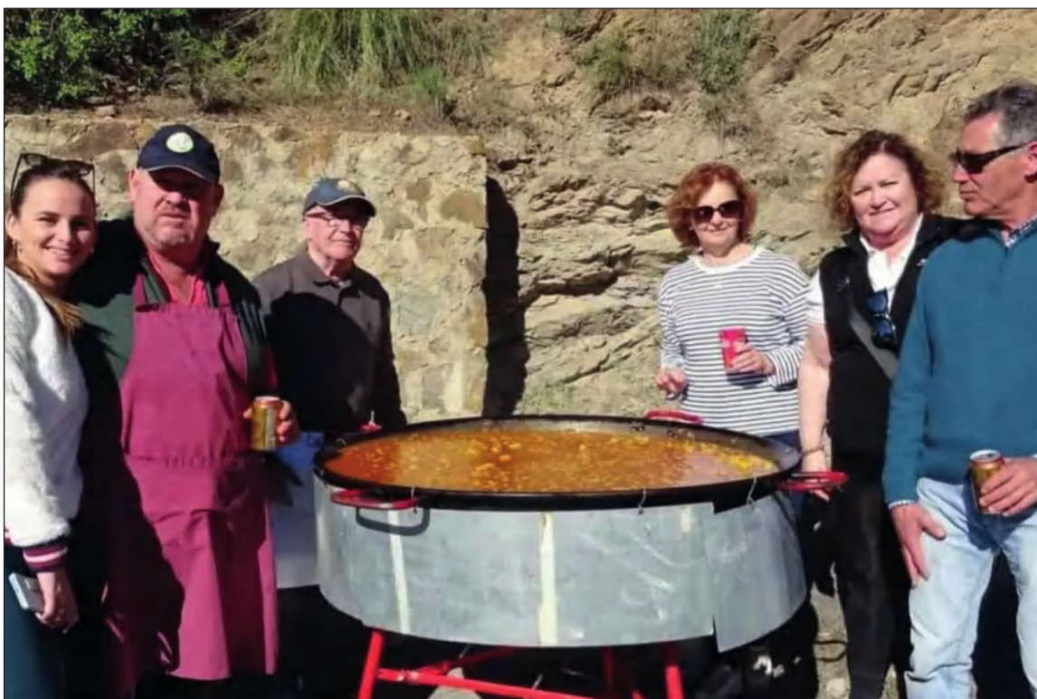
Paella preparada por los socios de la Peña El Palustre.