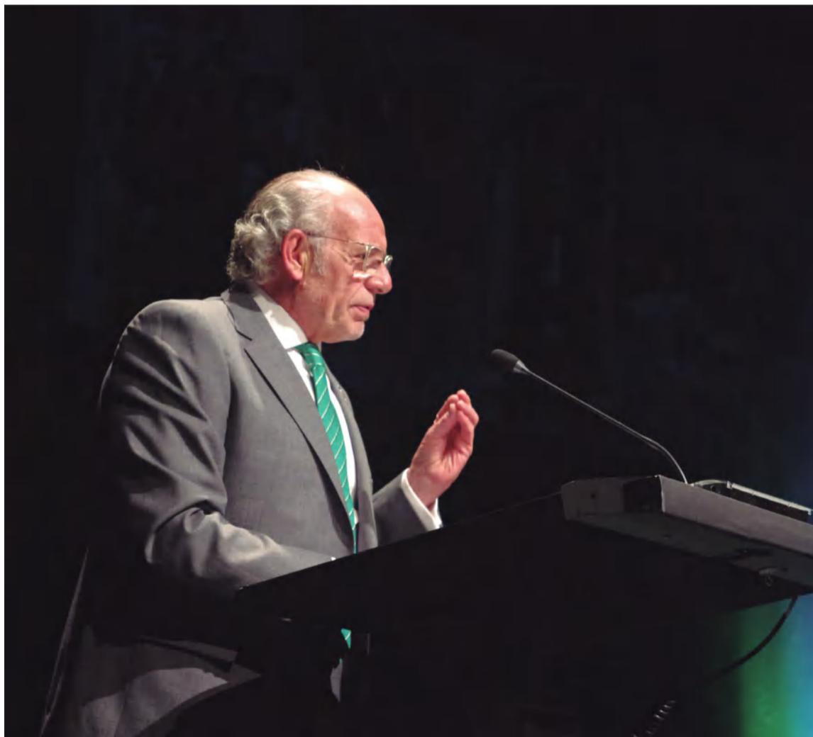
Será presentado por coco Jurado, pregonero del Día de Andalucía 2022.