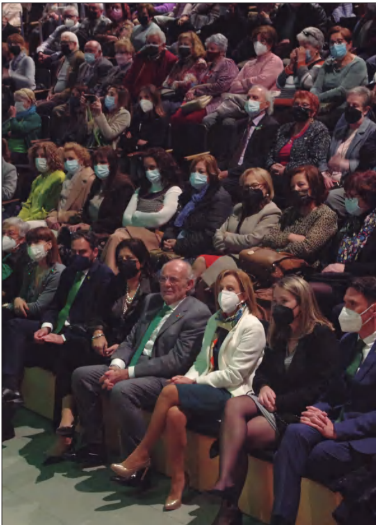
La Caja Blanca se estrena como escenario de esta actividad.