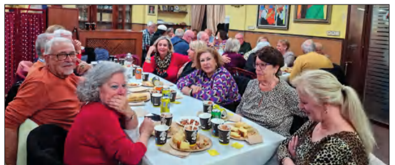
Vista del salón de la entidad durante esta actividad.

merienda mixta para la convivencia de sus socios y simpatizantes de esta entidad federada.