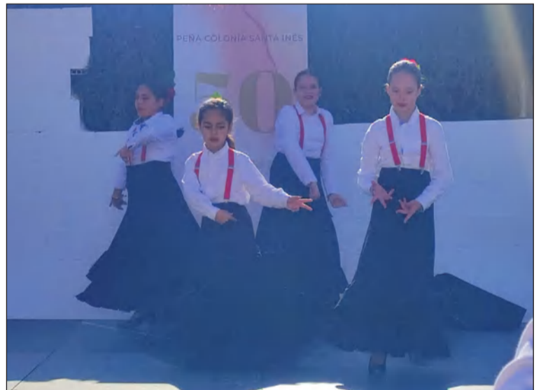
Grupo de baile de la Asociación de Vecinos Hanuca.

Hay cosas que son exclusivamente malagueñas