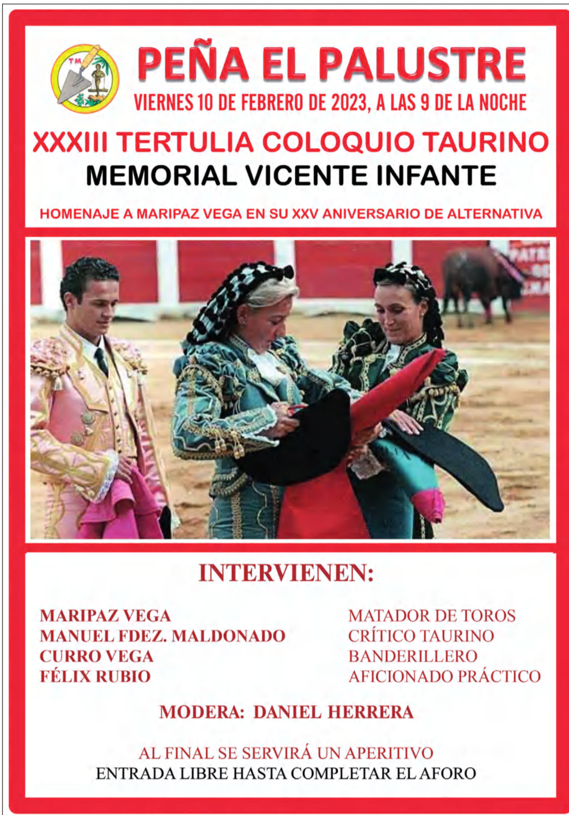
Cartel de la Tertulia Coloquio Taurino.

A su conclusión se ofrecerá, como es tradicional, un aperitivo para los asistentes. La entrada es libre hasta completar en aforo.