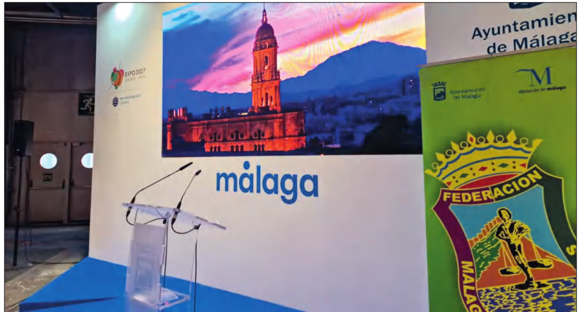
La Federación Malagueña de Peñas ha estado representada en el Stand de Málaga en FITUR 2023.

Agradecemos la confianza del Ayuntamiento de Málaga en este proyecto en el que seguimos trabajando; así como la disposición del Alcalde por recibirnos en este inicio de año para escuchar nuestras preocupaciones e inquietudes, que siempre son por hacer un colectivo peñista y una Málaga en general mucho mejores.