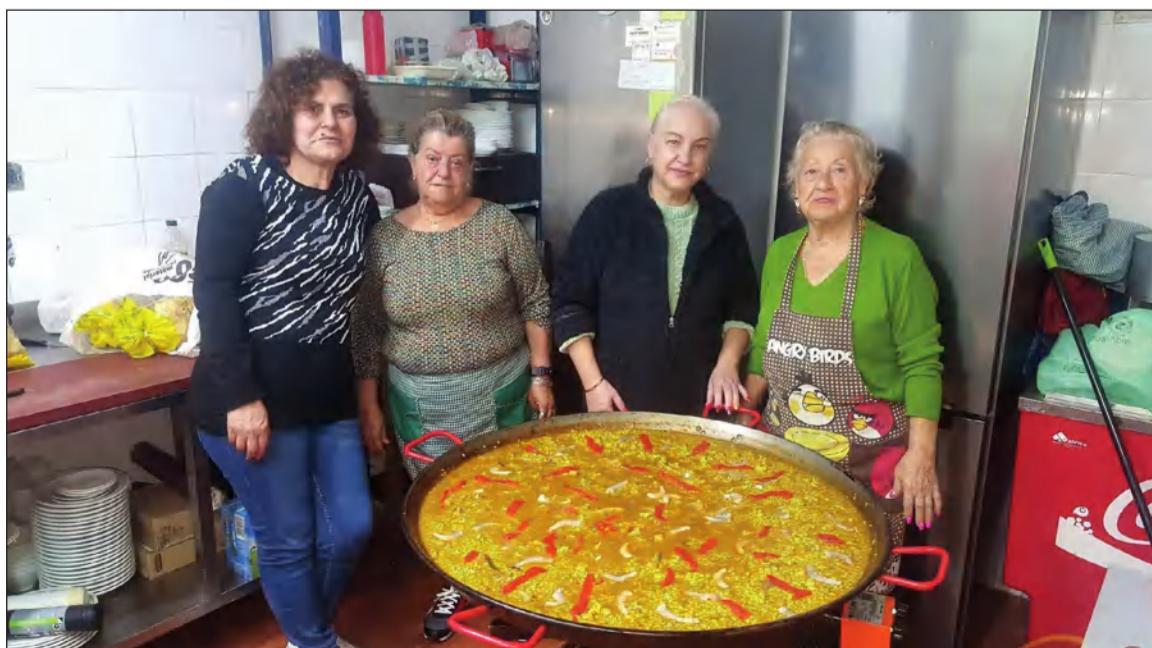
Socias encargadas de preparar el arroz.

socios de esta entidad perteneciente a la Federación Malagueña de Peñas disfrutara de una jornada de convivencia.