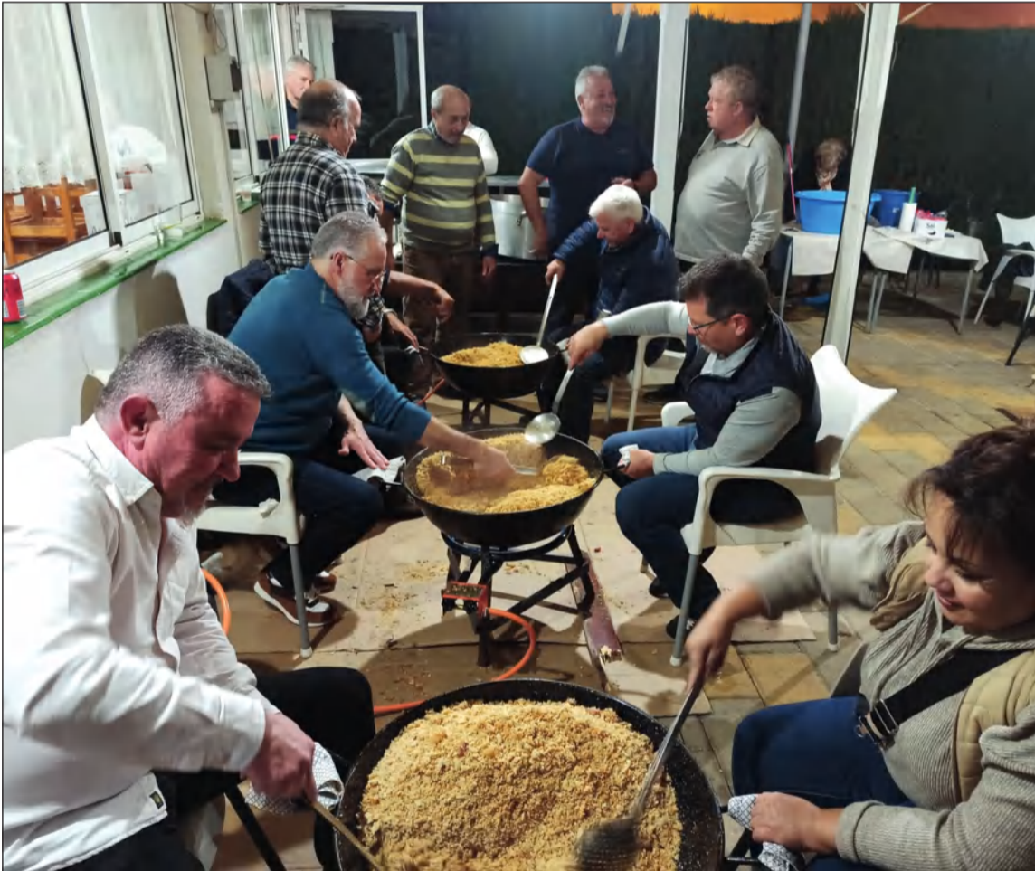
Socios de la Peña Colonia Santa Inés se encargaron de la preparación de las Migas.