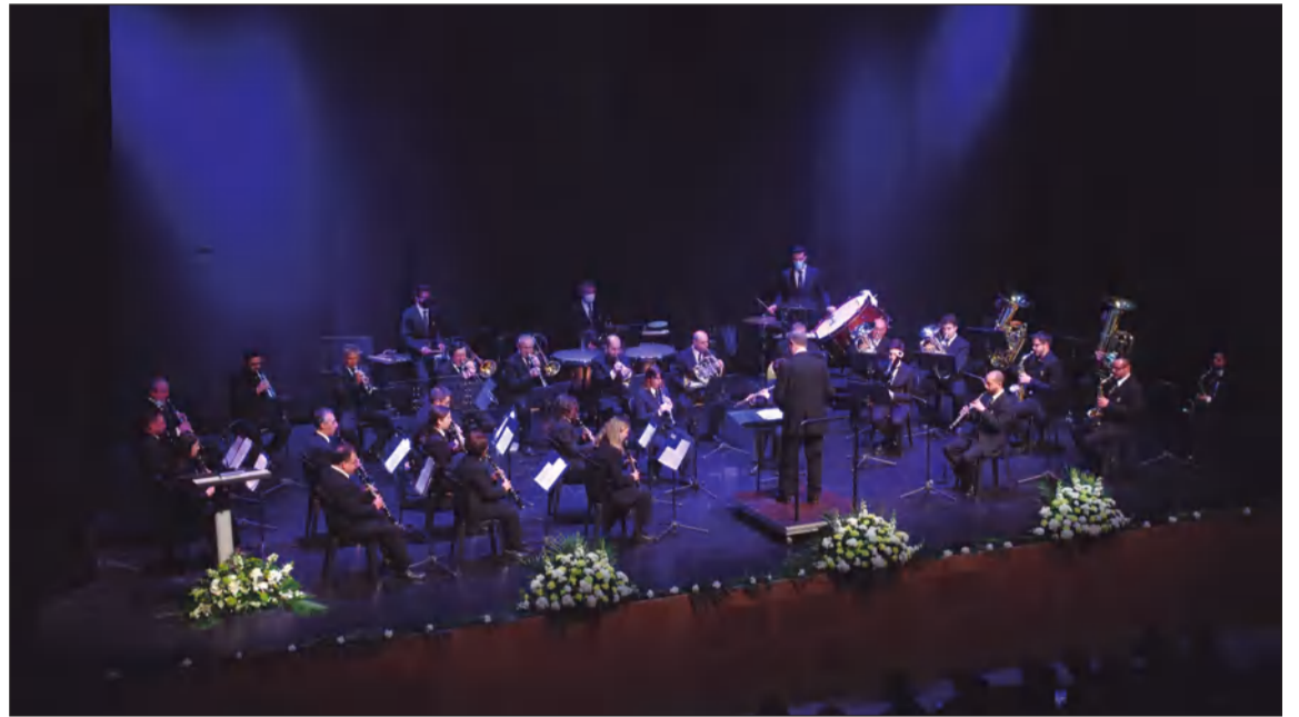
La Banda de Música Municipal será la encargada de cerrar el acto.