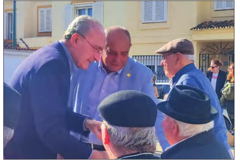
El alcalde saluda a algunos de los asistentes.