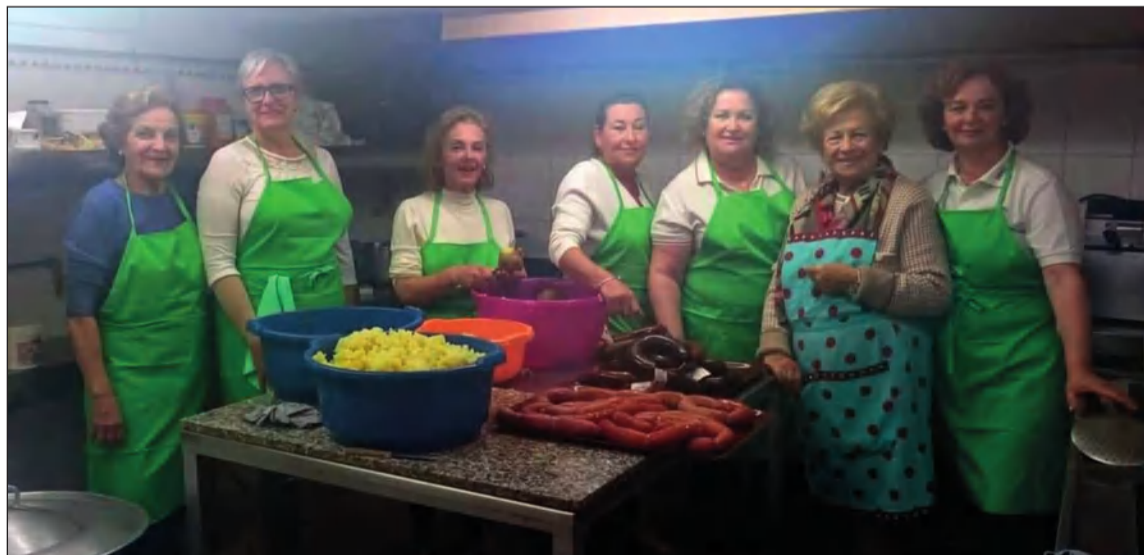
Encargadas de preparar la comida del segundo sábado de mes.