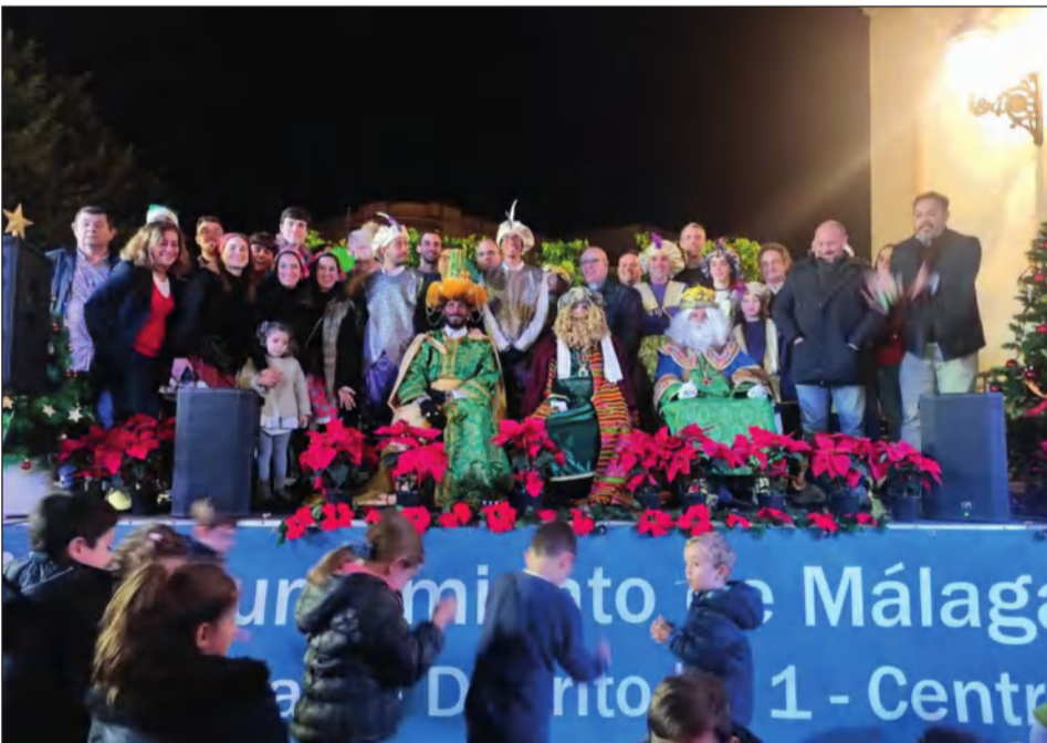
Multitudinaria bienvenida a Melchor, Gaspar y Baltasar en el Santuario de la Victoria.