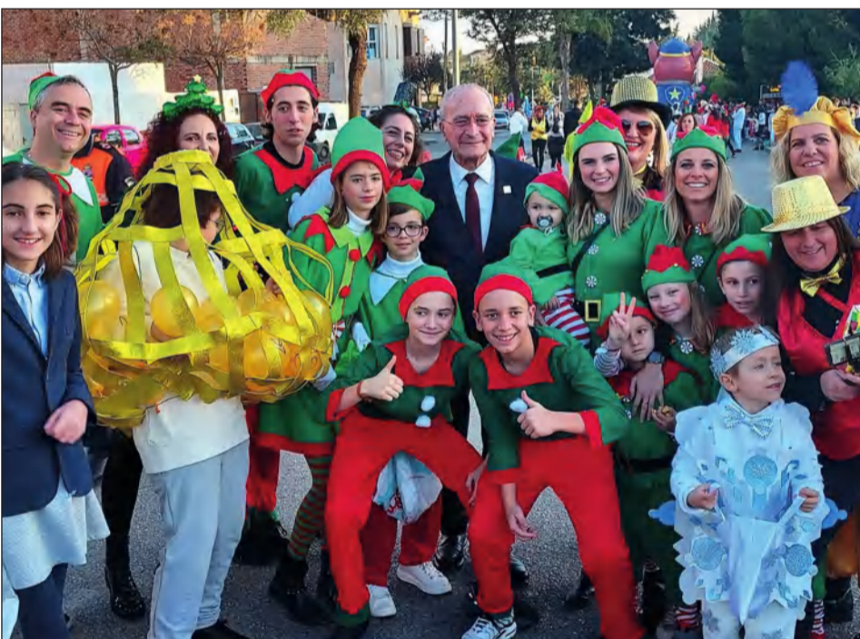
El alcalde comparte la ilusión de los vecinos en el desfile de Puerto de la Torre.