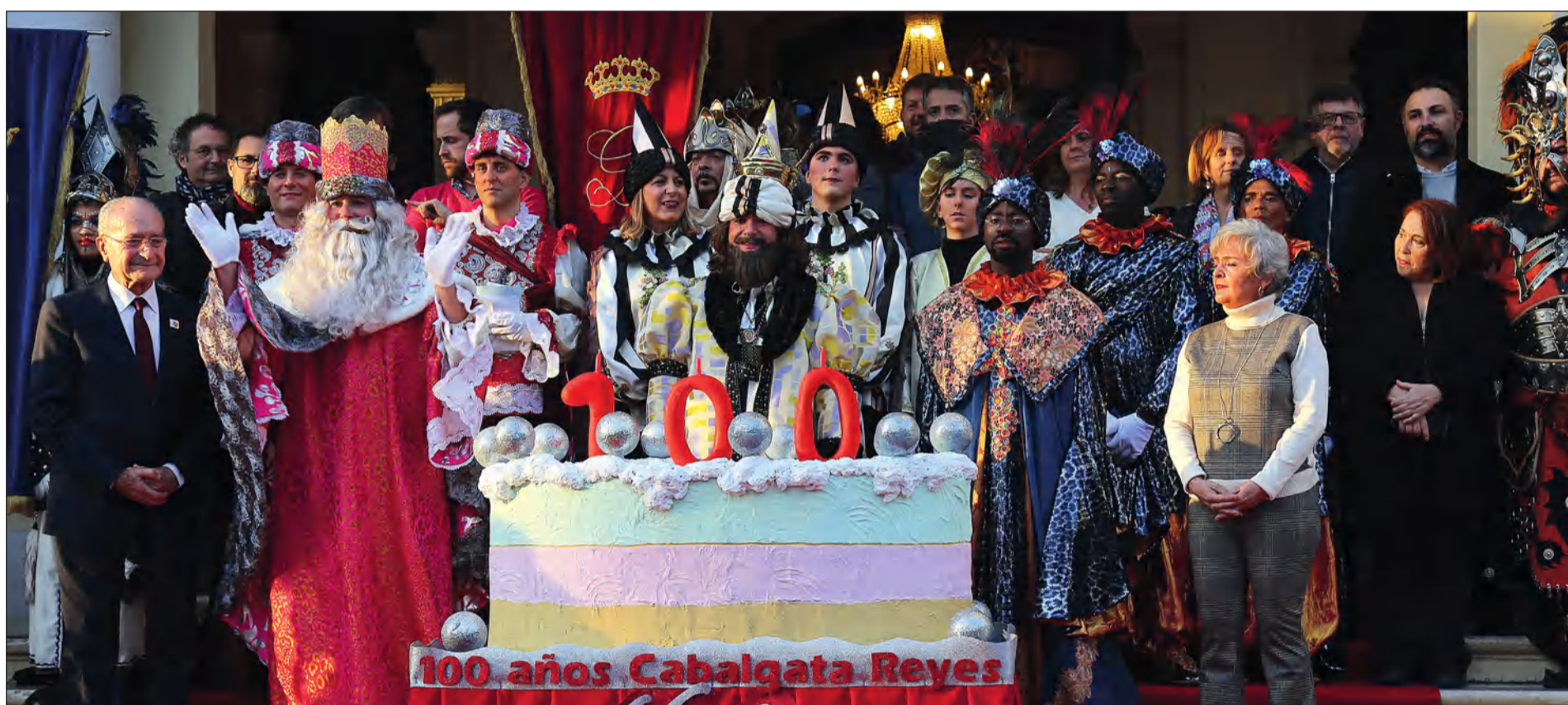
El pasado 5 de enero, Sus Majestades regresaron a nuestra ciudad en conmemoración del centenario de su primera cabalgata por las calles malagueñas.

Web: www.femape.com Edición digital: www.femape.com/laalcazabadigital Twitter: @FMPLaAlcazaba Facebook: FMPLaAlcazaba