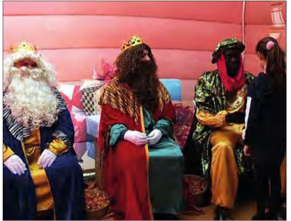
Ciudad Jardín celebró una gran fiesta en honor a Sus Majestades.