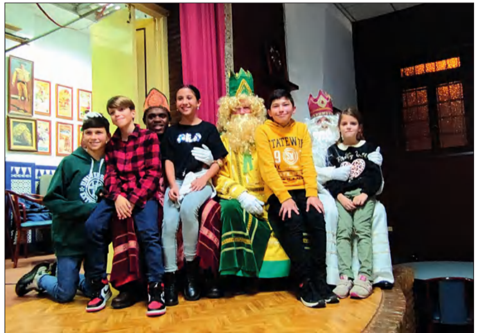
Los Magos de Oriente, rodeados de niños en la sede de la Peña El Palustre.