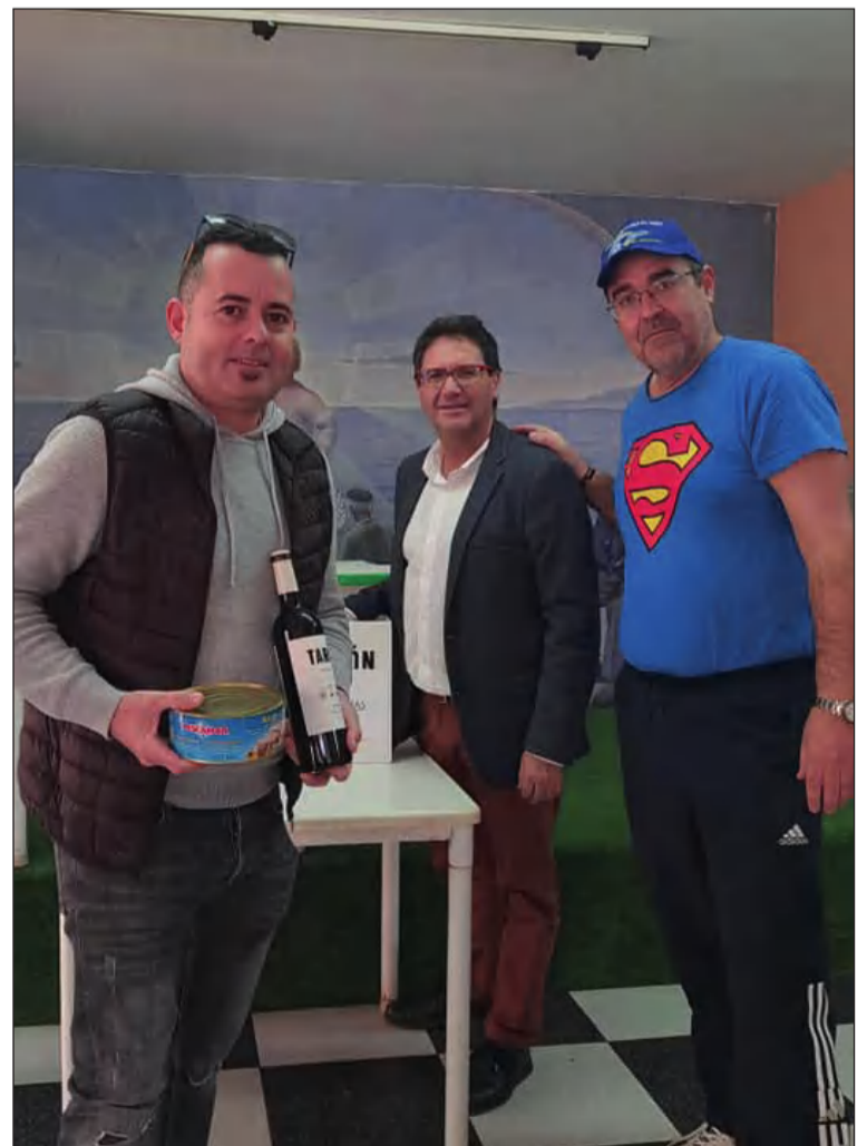
Se sortearon diversos lotes entre los socios.