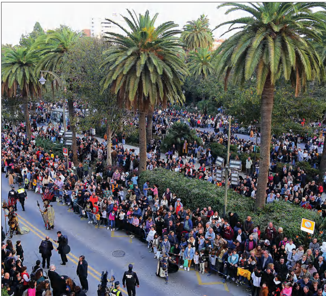
Ambiente en el Paseo del Parque para esperar la llegada de los Magos de Oriente.