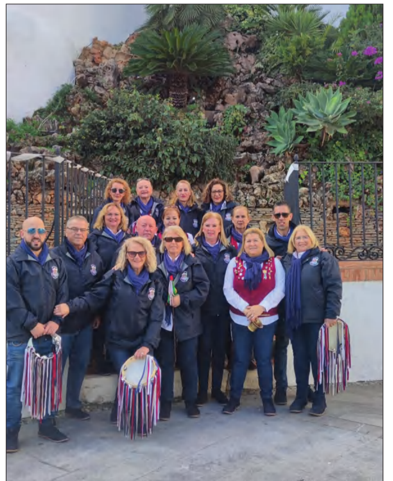
Componentes de la pastoral, en una de sus salidas durante estas fiestas.