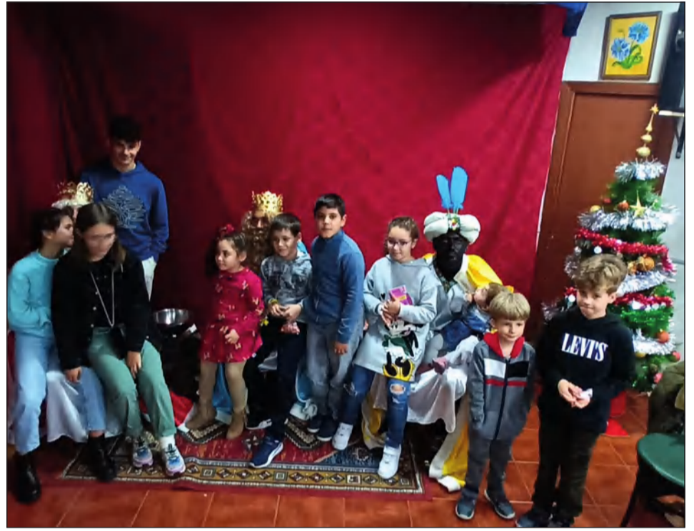
La Peña Cruz de Mayo organizó una merienda infantil en honor a Sus Majestades.