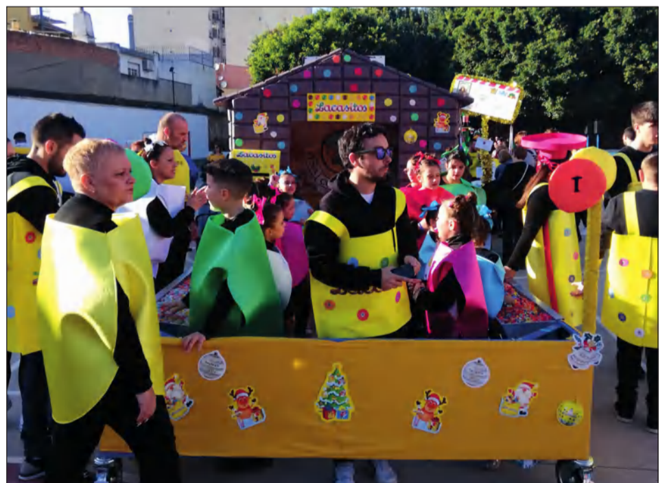
La Peña Costa del Sol, en la cabalgata del Distrito Carretera de Cádiz.