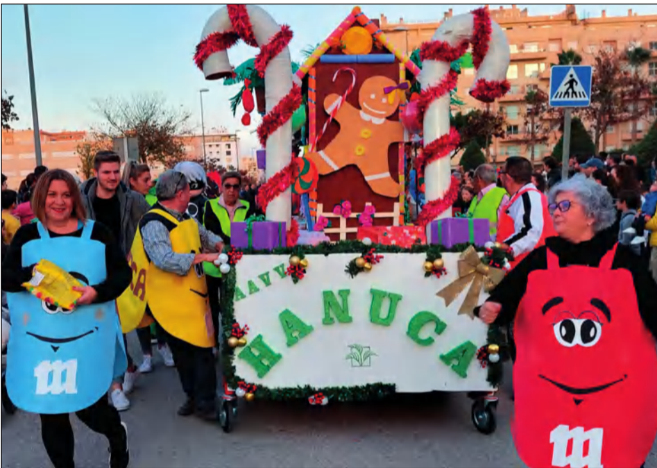
La AVV Hanuca Finca La Palma acompañó a los Reyes en la cabalgata de su distrito Teatinos.