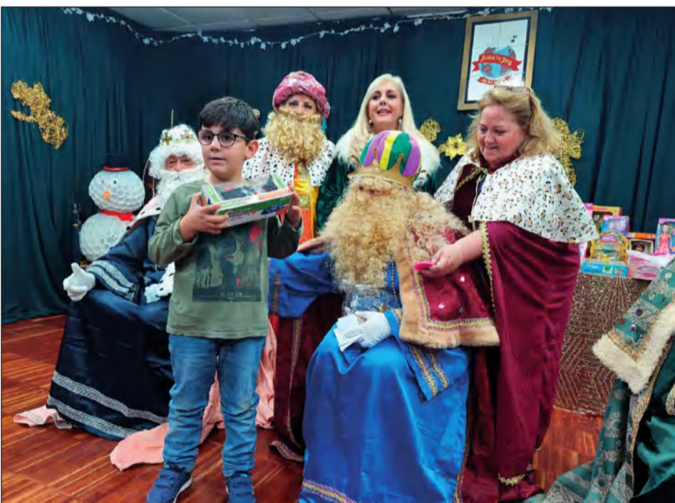
Los Reyes Magos llegaron cargados de regalos a la Peña La Paz.