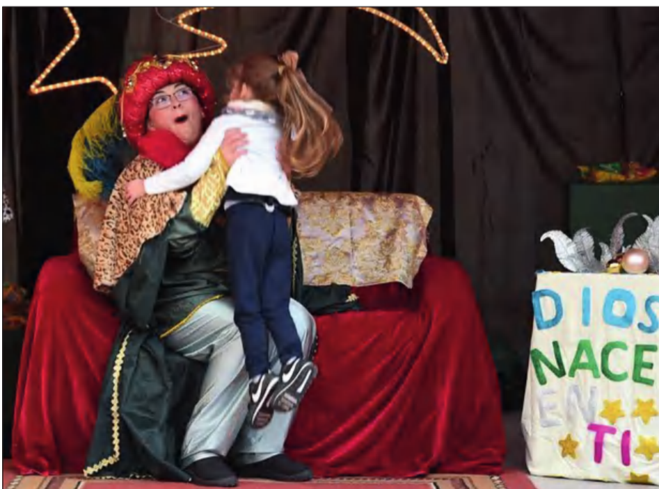
Fiesta de los Reyes Magos en el Distrito Campanillas.