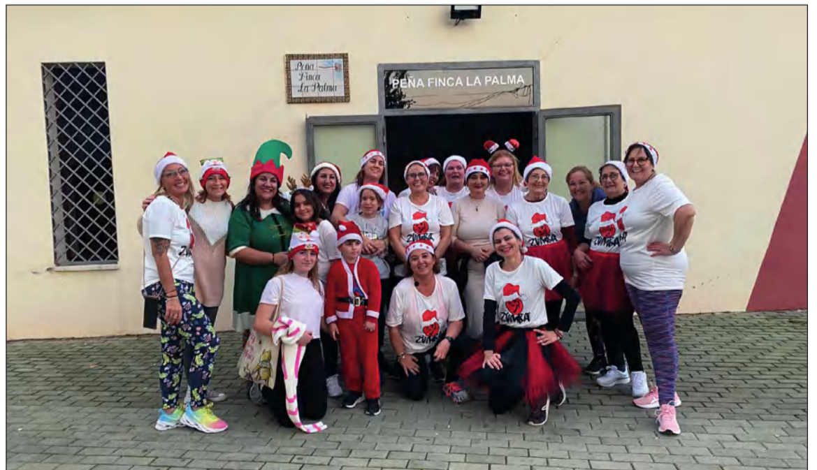
Algunas de las componentes del grupo de animación tras uno de los ensayos realizados.

han ensayado las coreografías y diseñado y confeccionado sus propios trajes en unas duras jornadas que han sido muy gratificantes para todos los participantes.