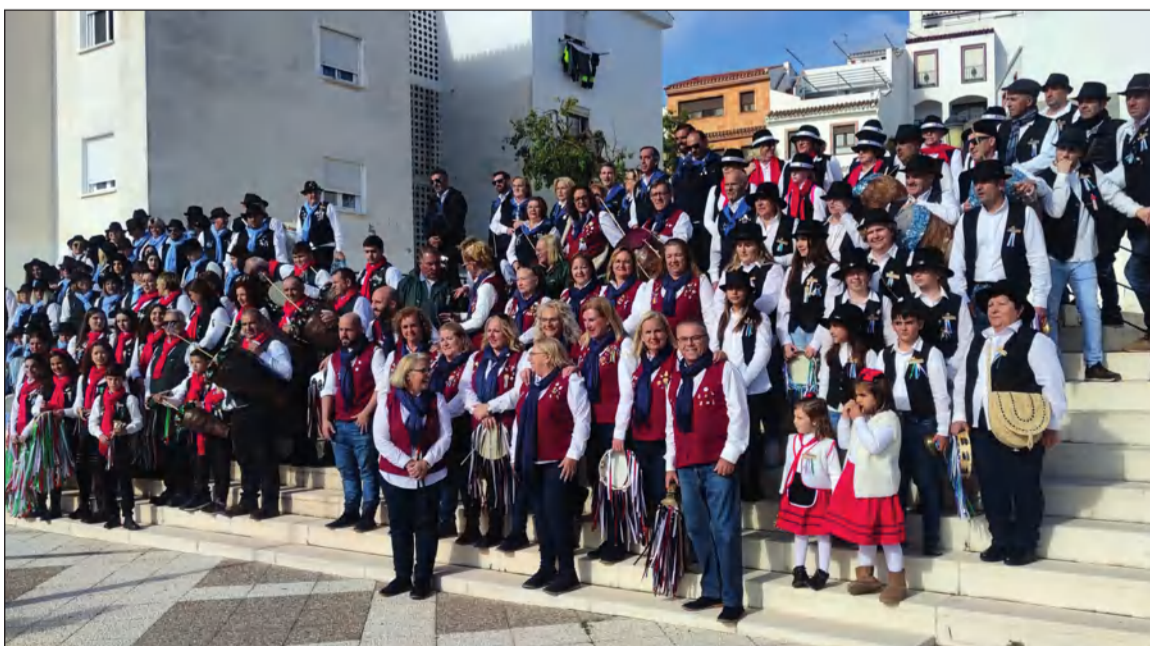
Los encuentros de pastorales sirven para crear lazos de amistad con otros grupos de la provincia.

Un año más, los integrantes de esta entidad han revivido los villancicos tradicionales.