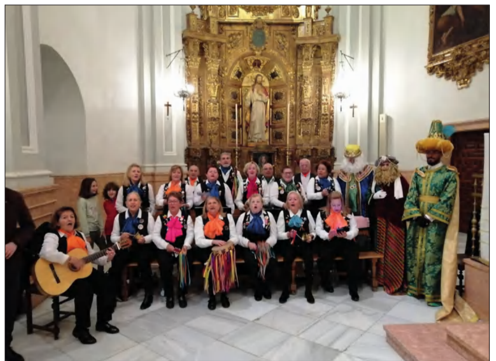
El Coro de la AVV Victoriana de Capuchinos le cantó a los Reyes en la iglesia de la Divina Pastora.