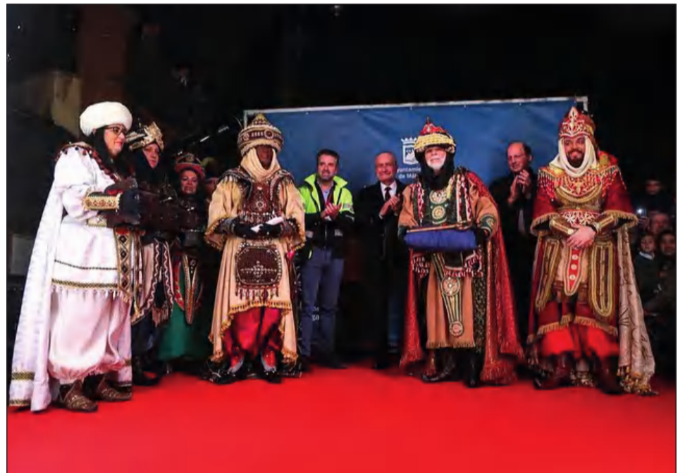
Recepción a los Reyes en el Distrito Málaga Este.