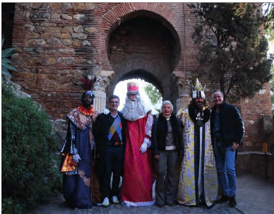
Los Reyes Magos pernoctaron en la Alcazaba.