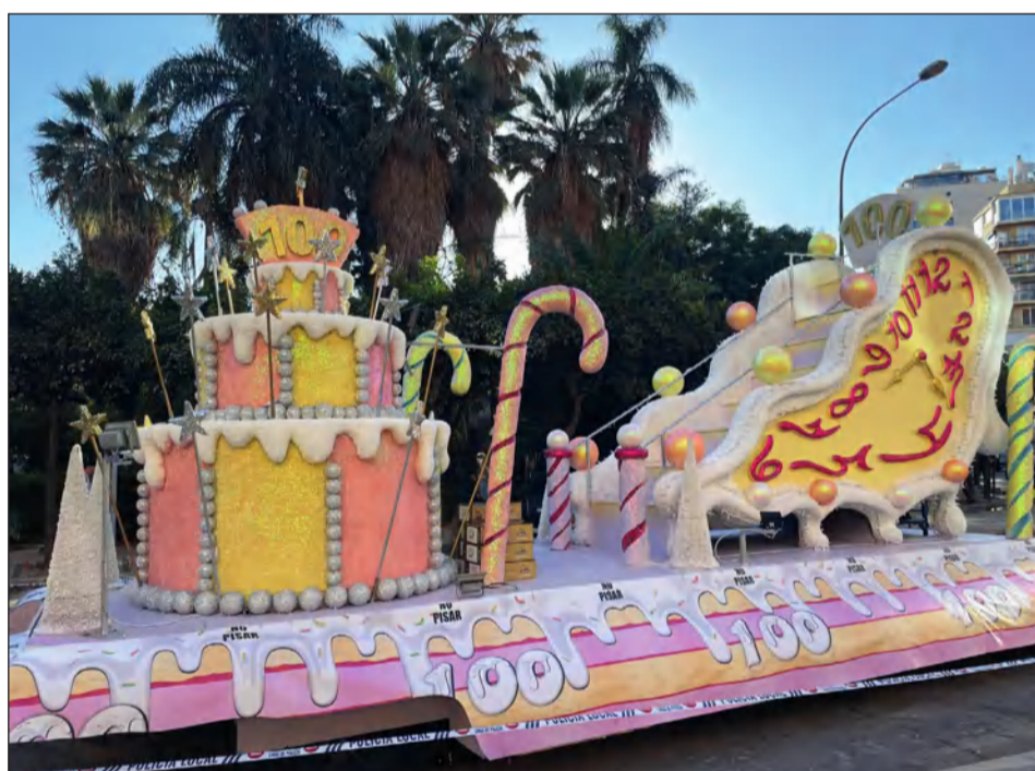
Carroza conmemorativa del centenario de la cabalgata de Reyes Magos de Málaga.