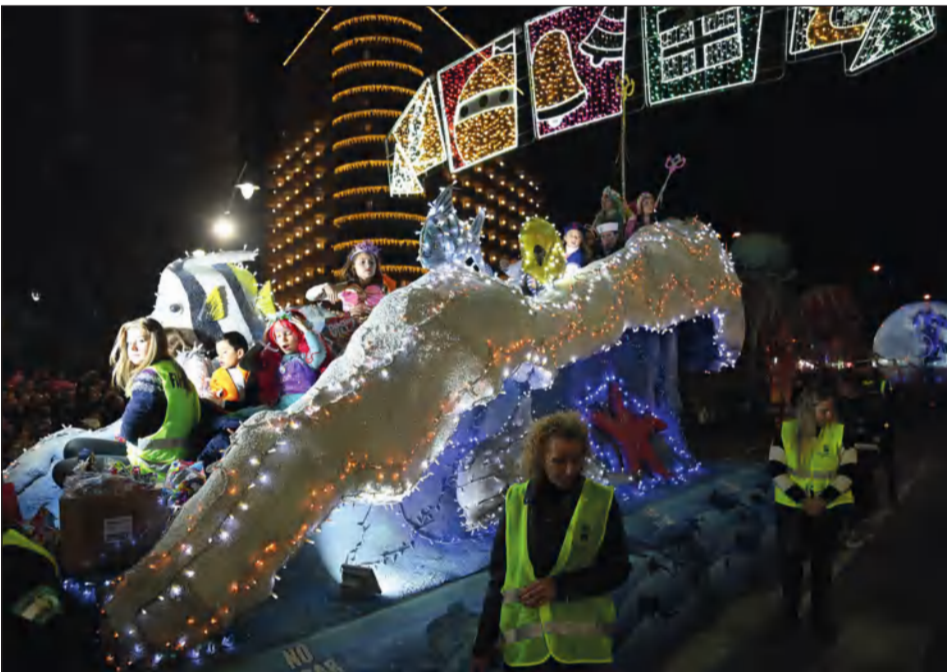
La carroza de la Federación Malagueña de Peñas.