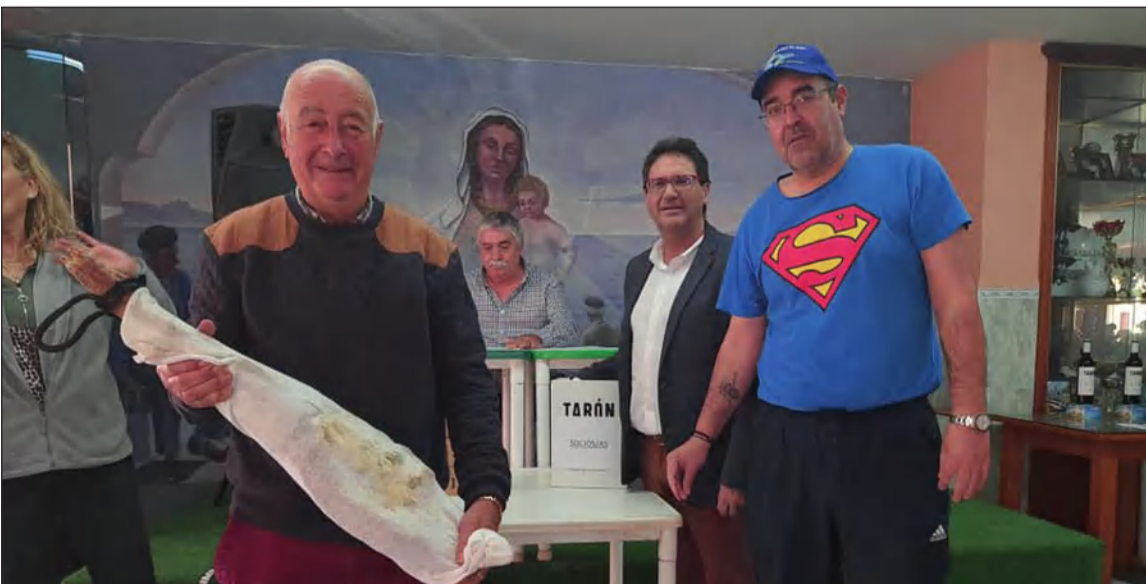
Ganador de uno de los jamones sorteados.

unas felices fiestas y vivir esta jornada tan significativa para todos ellos, sobre todo para los agradados con alguno de los premios.