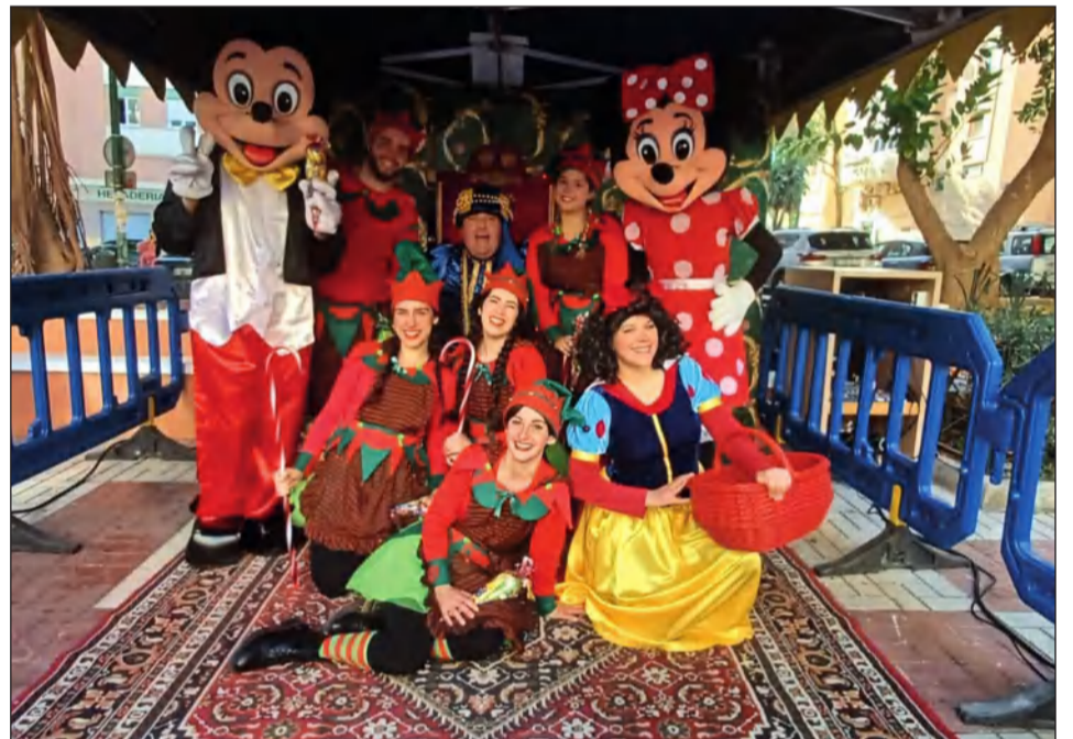
El Cartero Real acudió acompañado por personajes infantiles a Palma Palmilla.