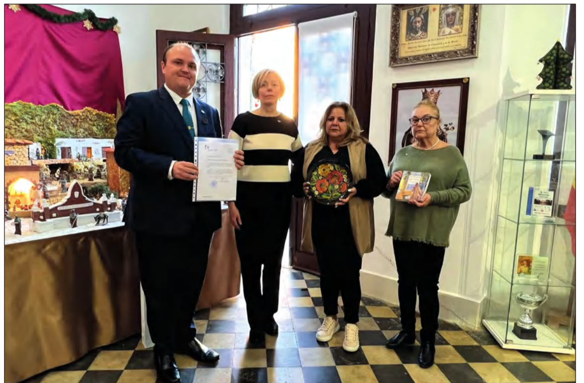
Visita de la Cónsul de Ucrania a la Asociación.