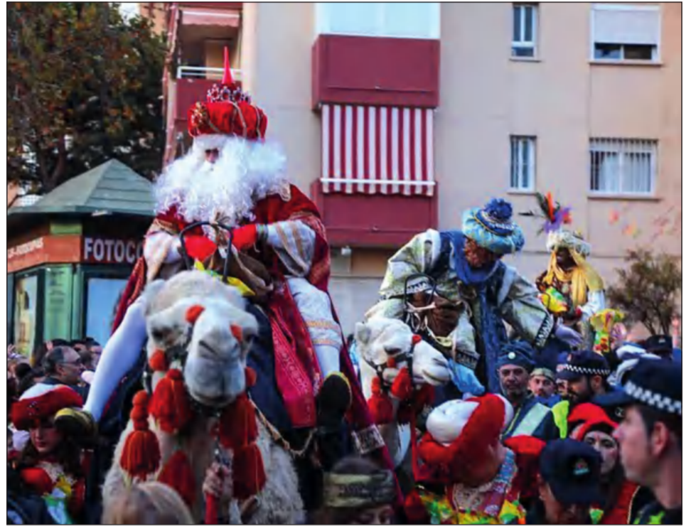
Los Magos de Oriente acudieron con sus camellos a la cabalgata de Cruz de Humilladero.

En muchas de estas celebraciones se ha contado con una participación activa de las entidades que conforman la Federación Malagueña de Peñas, Centros Culturales y Casas Regionales 'La Alcazaba'.