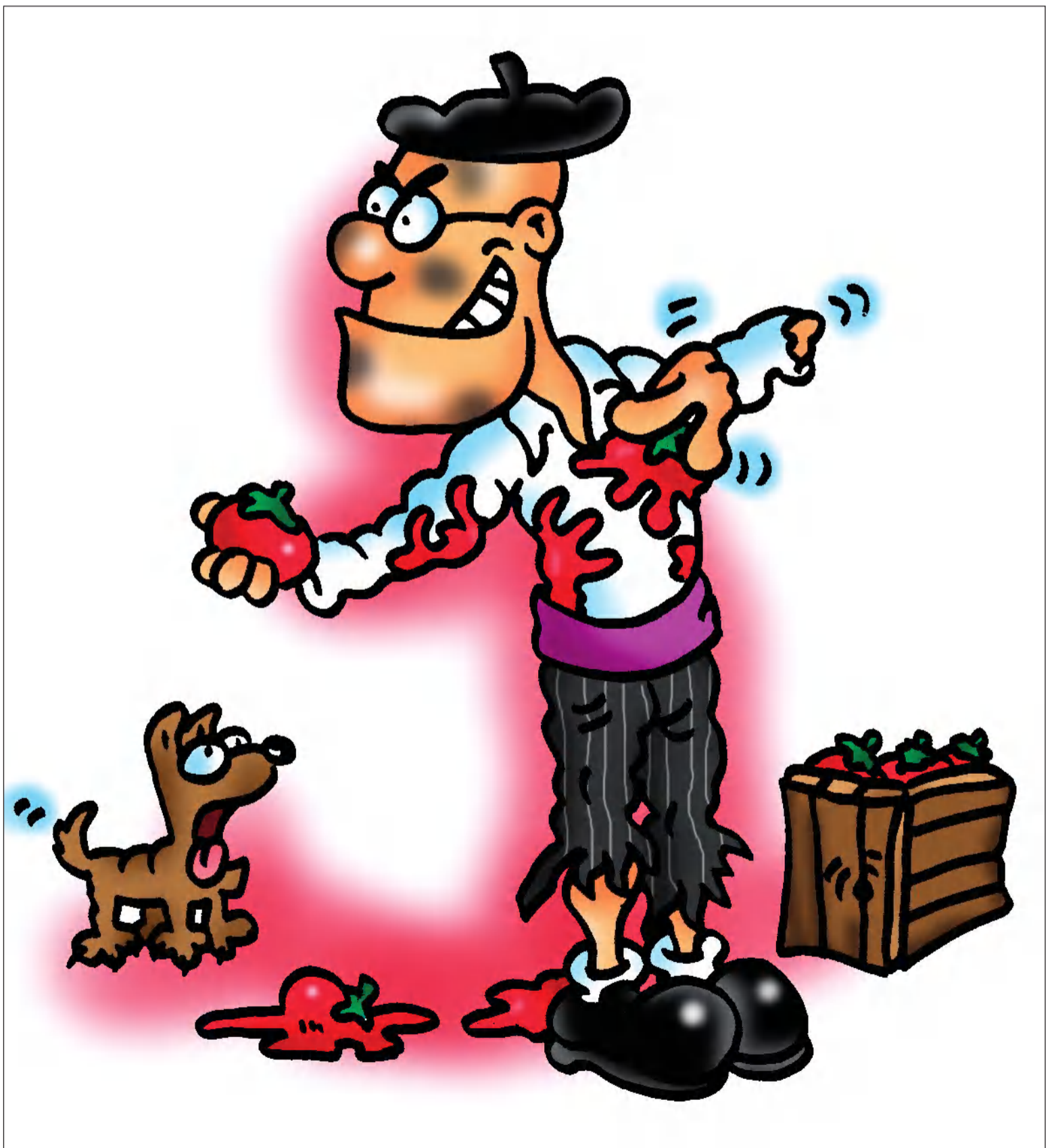
Ilustración de Enrique García.

- "¿San enterao ustedes lo der sargento de los civiles nuevo, que han mandao a este pueblo?..".