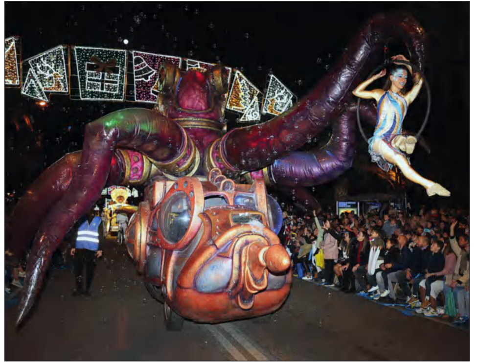
La fantasía también estuvo representada en la cabalgata.