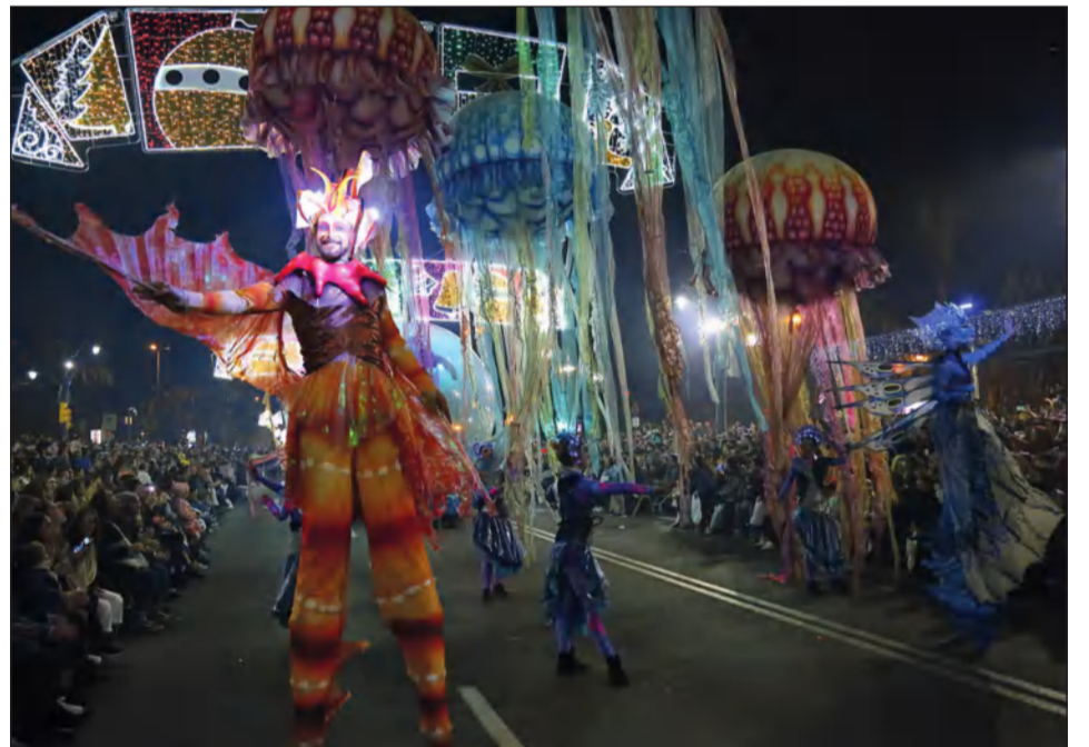
Niños y mayores disfrutaron de la llegada de los Reyes Magos al Centro de Málaga.