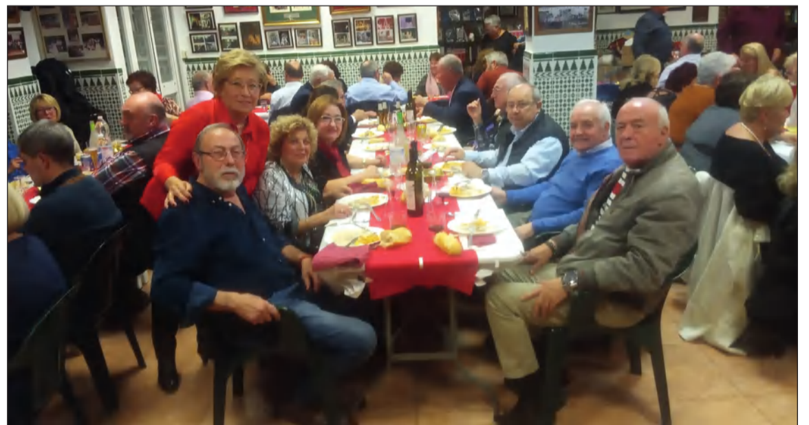
Vista de la sede durante la II Fiesta de la Uva.

Por otra parte, desde la Peña Perchelera se hacía entrega al párroco de El Carmen de todos los alimentos recogidos durante la colecta promovida en las vísperas de la Navidad.