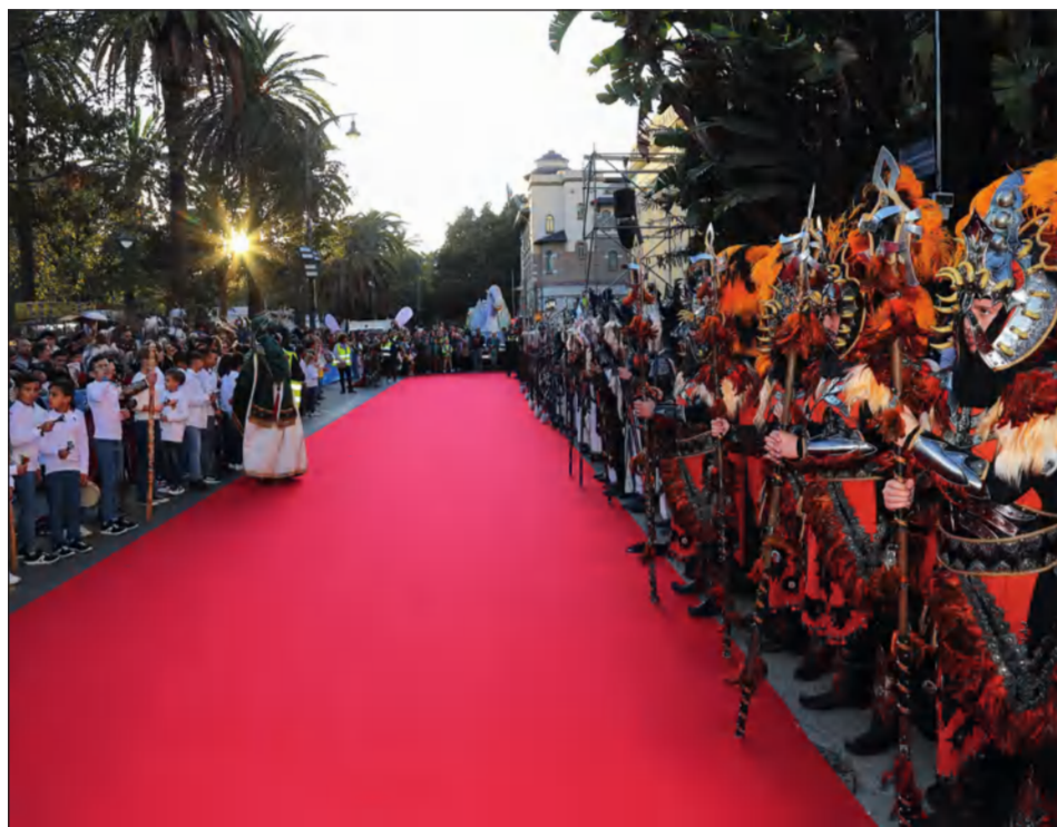
Guardia que cortejó a los Reyes durante la cabalgata.