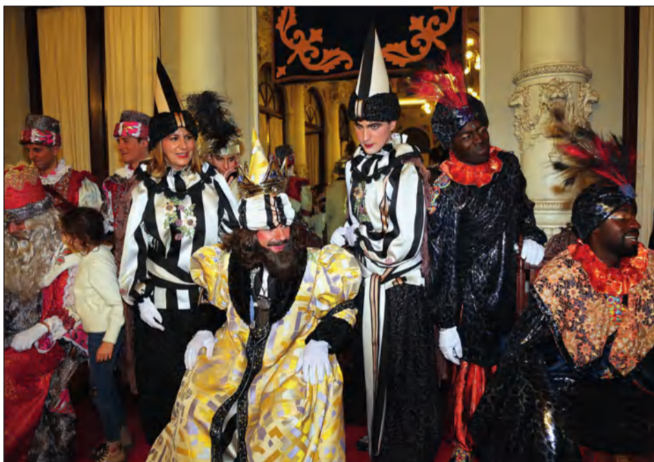
Recepción a Melchor, Gaspar y Baltasar en el Ayuntamiento,