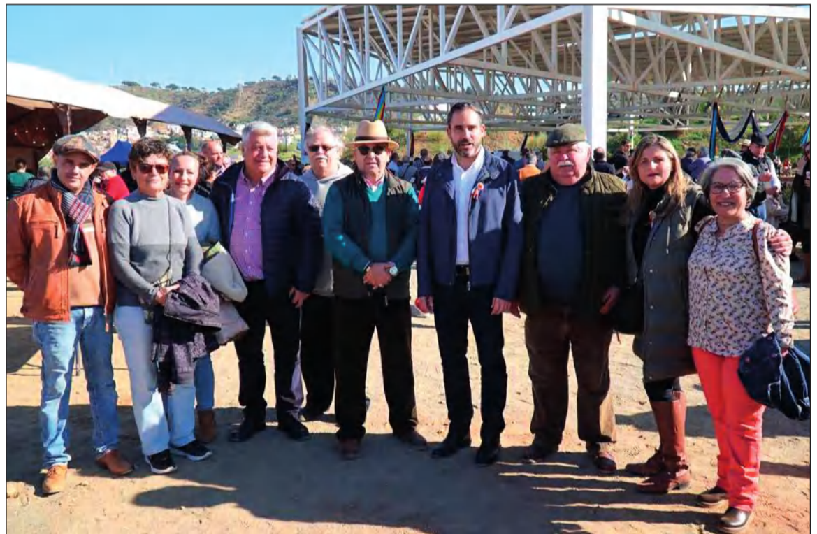
Representantes peñistas con la comitiva socialista que asistía a la Fiesta.

Hay que recordar que en 2014 el Ayuntamiento de Málaga aprobó una moción institucional para solicitar a la UNESCO la declaración de los Verdiales como Patrimonio Cultural Inmaterial de la Humanidad.