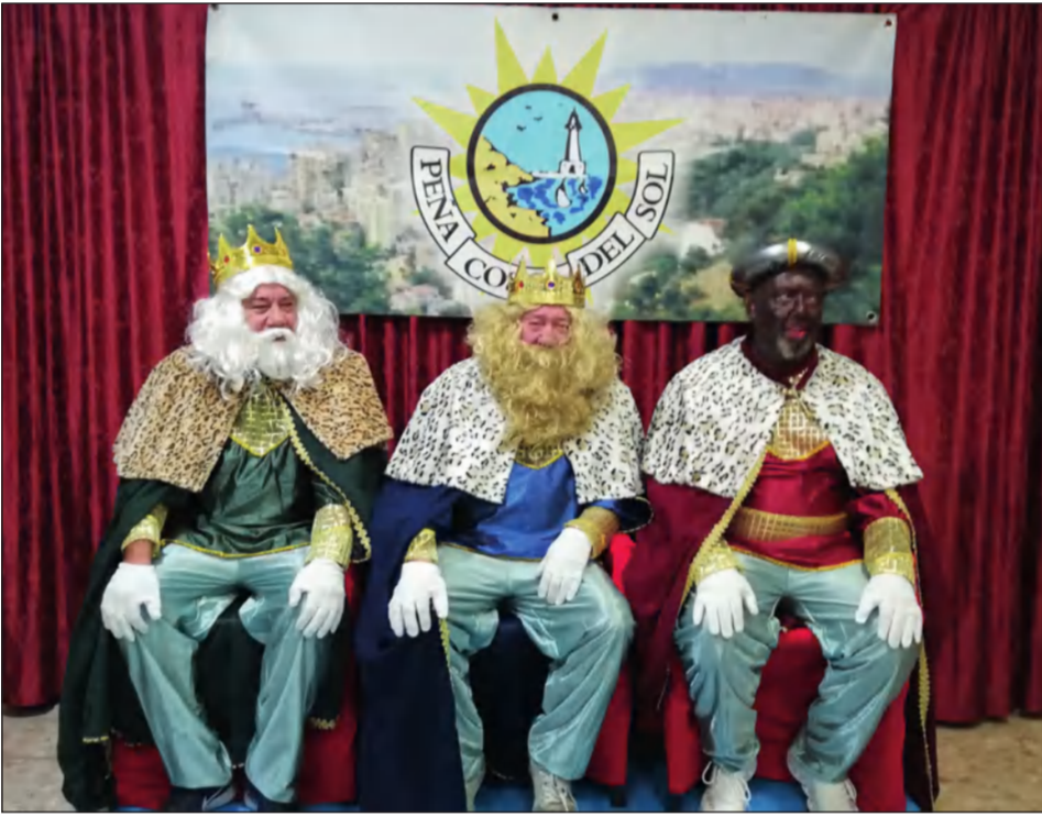
Melchor, Gaspar y Baltasar en la Peña Costa del Sol.