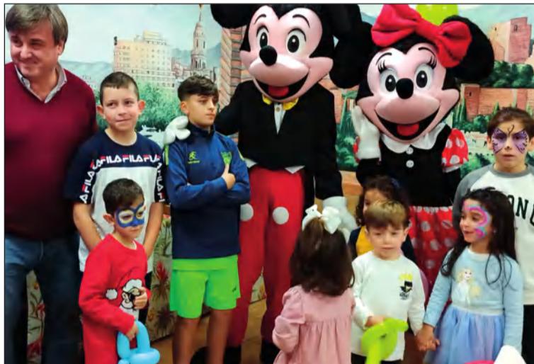
Los niños tuvieron su día el 28 de diciembre.

Se contó con la actuación del grupo Fiesta increíble, y a la finalización se ofrecía una merienda y chuches para todos los pequeños que participaron.