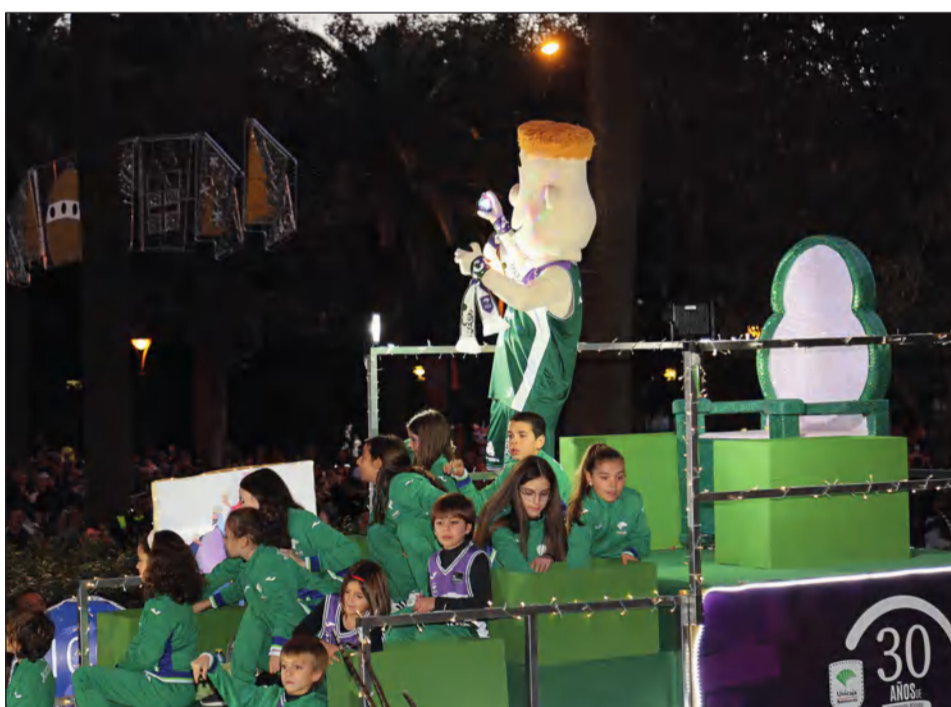
El Club Baloncesto Unicaja contó por primera vez con una carroza.