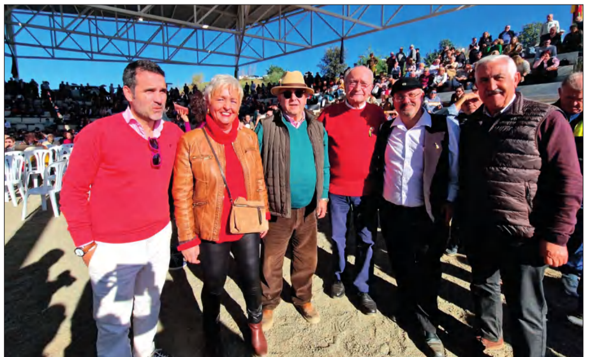
El presidente de la Federación con el alcalde y representantes de la corporación municipal.