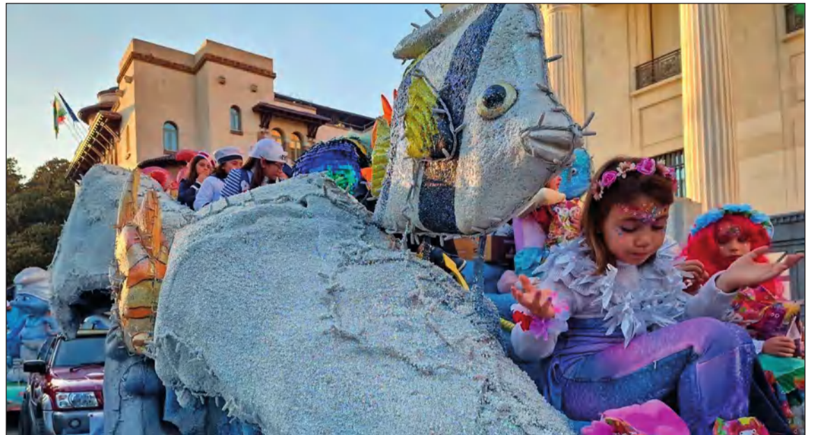
La primera actividad del año para los peñistas fue la Cabalgata de Reyes Magos.

SI ESTÁS BUSCANDO UN BANCO QUE PIENSE EN TI.