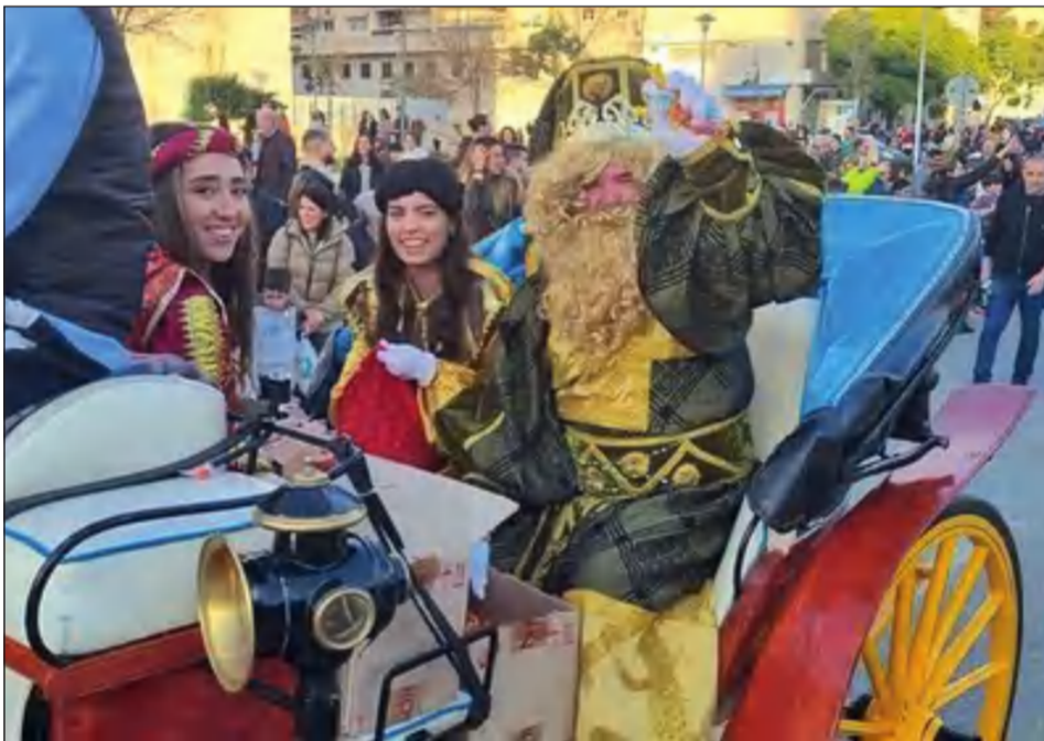
Los Reyes recorrieron Teatinos en coches de caballos.