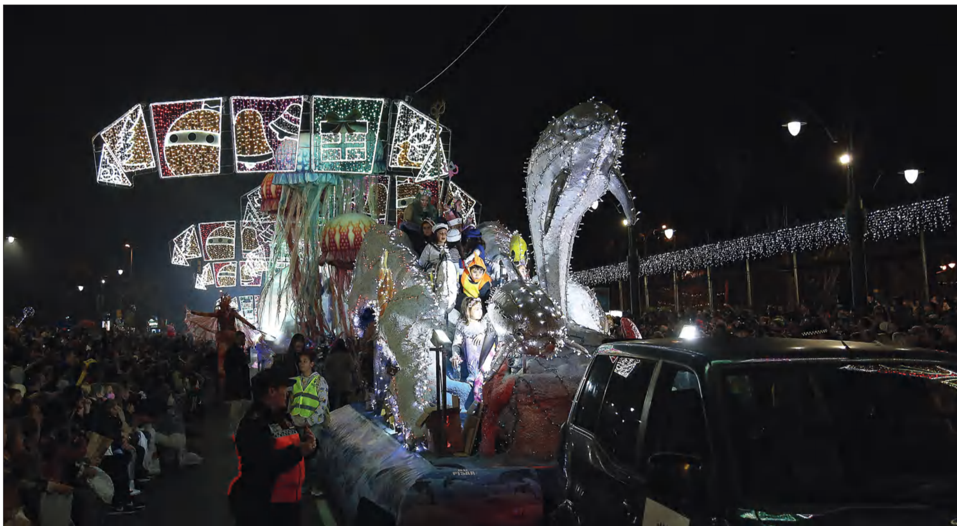
Carroza cedida este año por el Área de Fiestas a la Federación Malagueña de Peñas, a su paso por la Plaza de la Marina.

Desde allí, comenzaron a repartir ilusión a los miles de niños y mayores que siguieron el desfile, en un acto entrañable en el que cada año asiste el colectivo peñista para dar la bienvenida y acompañar a Melchor, Gaspar y Baltasar durante su recorrido por las calles de Málaga, previo a su visita a todos los hogares para dejar sus regalos.