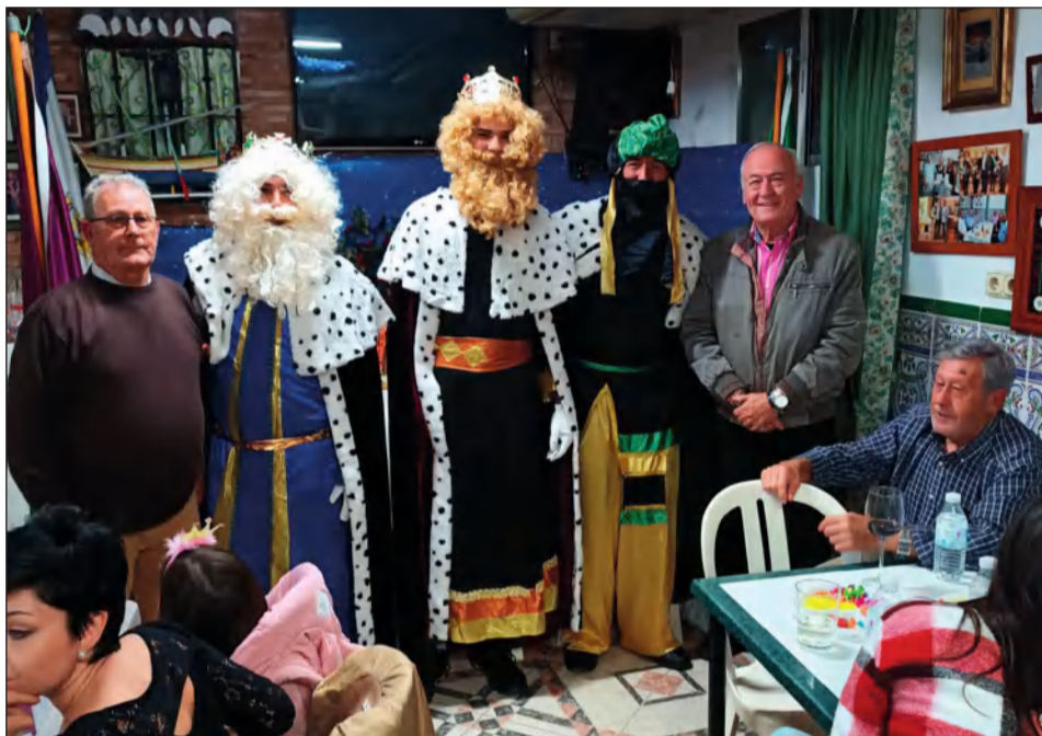
Los Reyes Magos en la Peña Los Bolaos.

Con ella, se daban por finalizadas unas fiestas navideñas que se han vivido en todos los casos con su carácter tradicional, y recuperando en muchos casos actividades que en sus últimas ediciones no habían podido desarrollarse por la pandemia. Compartimos una galería con algunas de las visitas de los Reyes Magos que nos han remitido las entidades para su publicación.