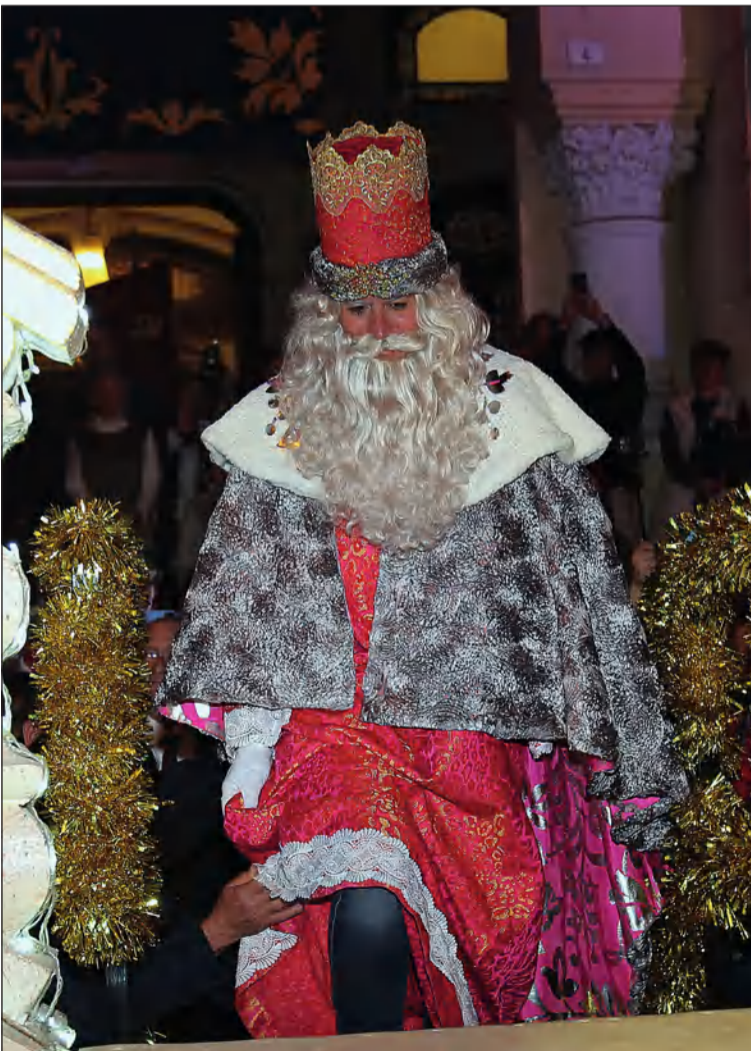
Instante en el que el Rey Melchor sube a su trono.