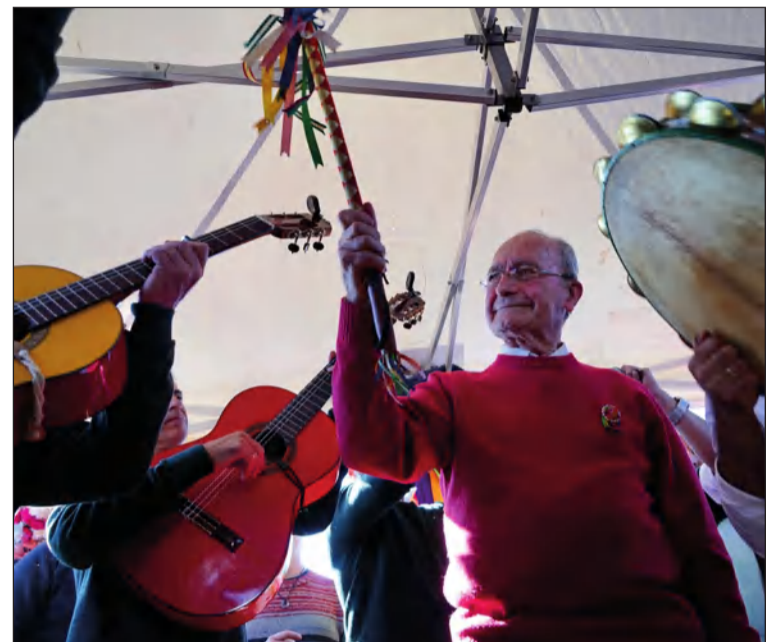
El alcalde dirige a una de las pandas participantes.

Puerto de la Torre para vivir con intensidad la Fiesta.