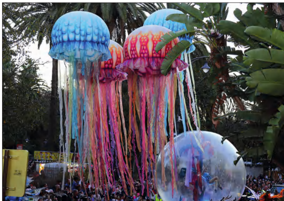
Espectacular pasacalles que formaba parte del cortejo.