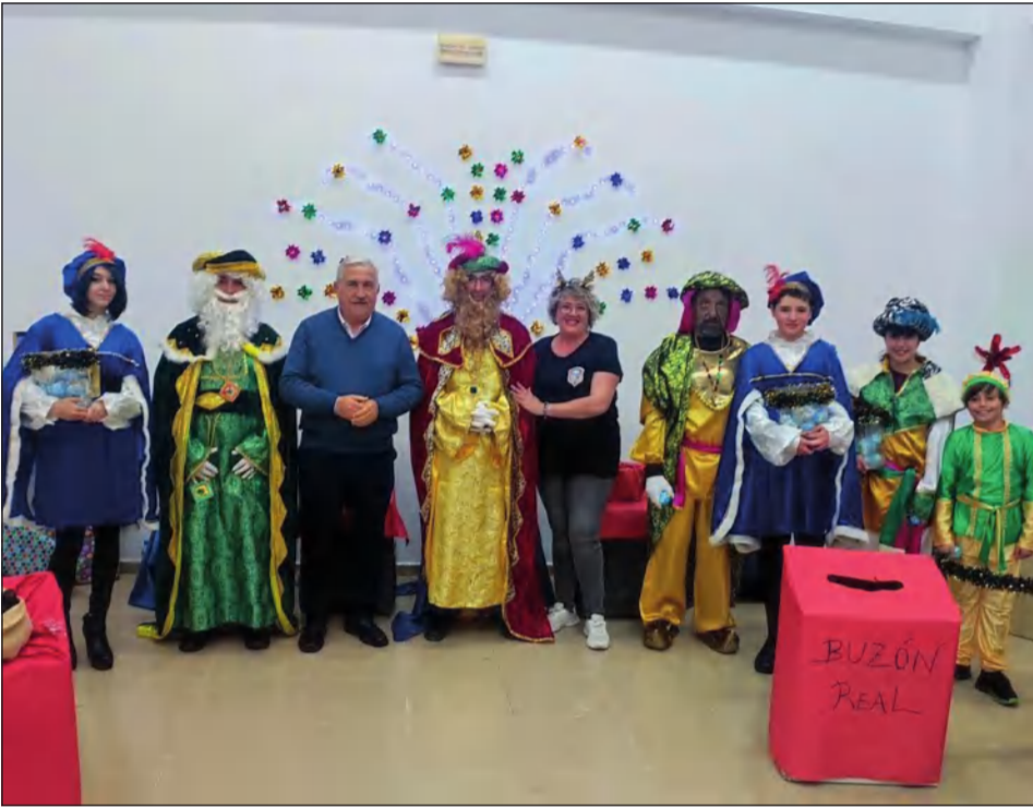
Los niños pudieron dejar sus cartas a los Reyes Magos en el Distrito Churrana.