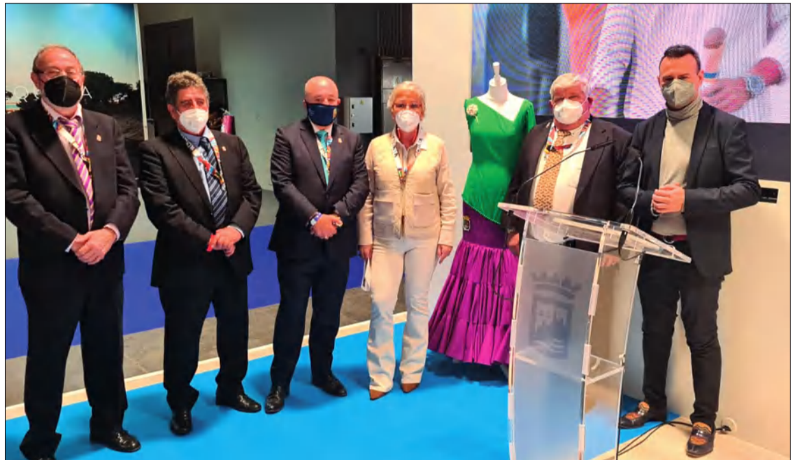
Presentación de Femape Flamenca en FITUR 2022.