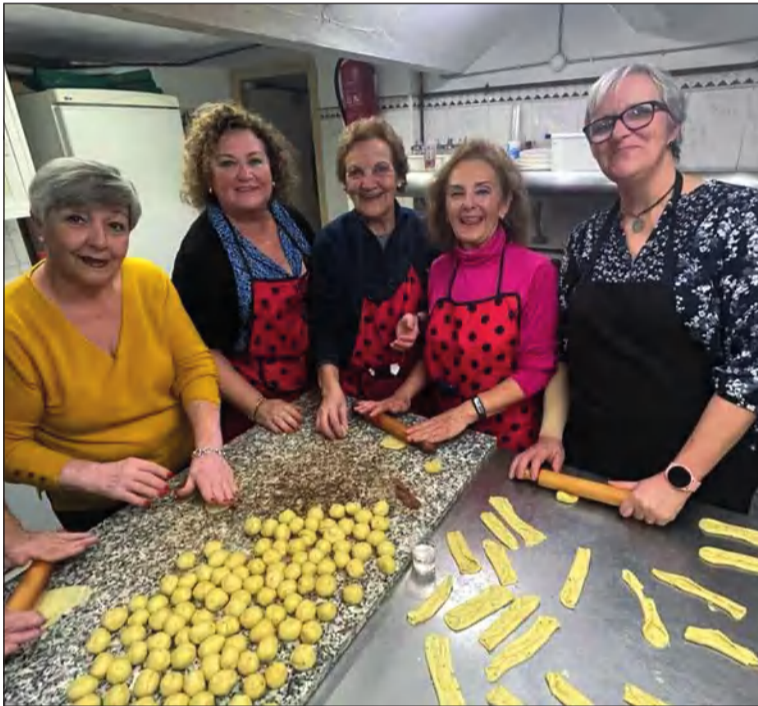
Fiesta de los Borrachuelos en la Peña El Palustre.

No han faltado durante estas navidades otras actividades tradicionales para la Peña El Palustre como su Fiesta de los Borrachuelos.