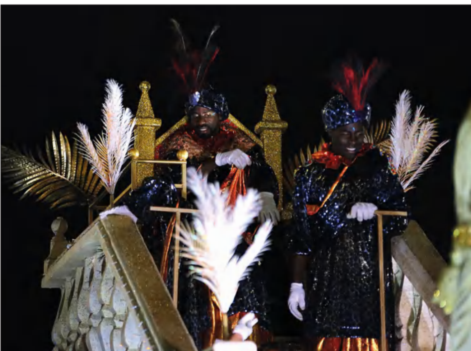
El Rey Baltasar era el encargado de cerrar el cortejo.