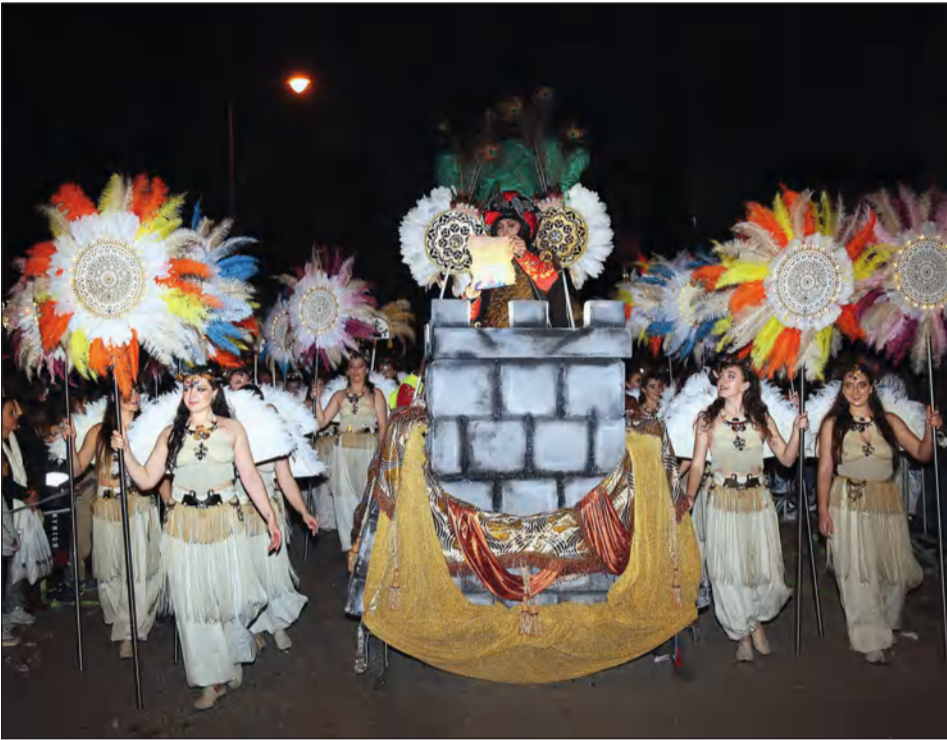
El desfile estuvo cargado de detalles y vistosidad.