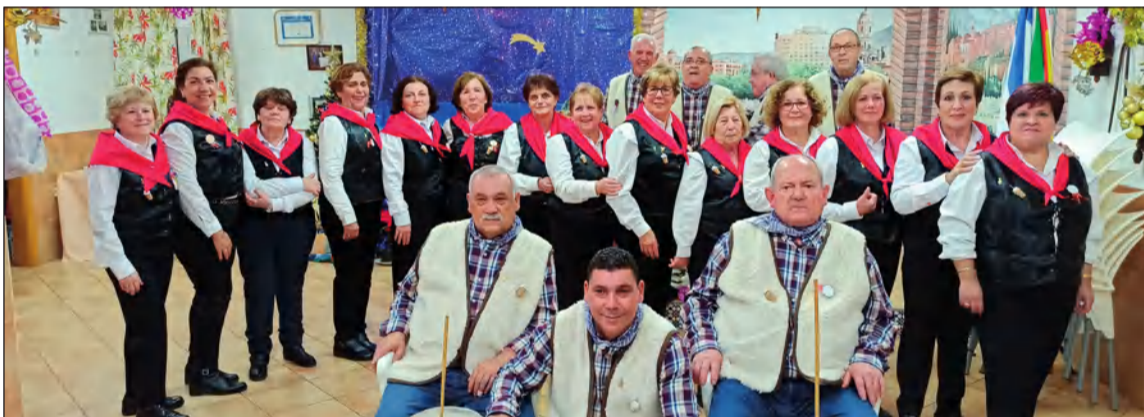
La pastoral ha vivido unas entrañables fiestas tanto dentro como fuera de su sede.