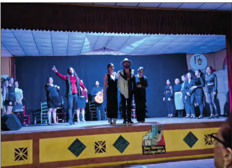
Mar de Rosas ofreció un gran espectáculo.