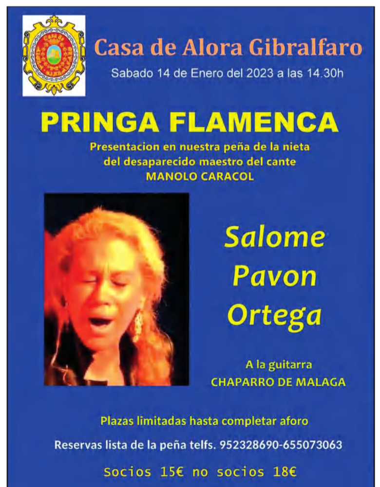
Cartel de la actividad.