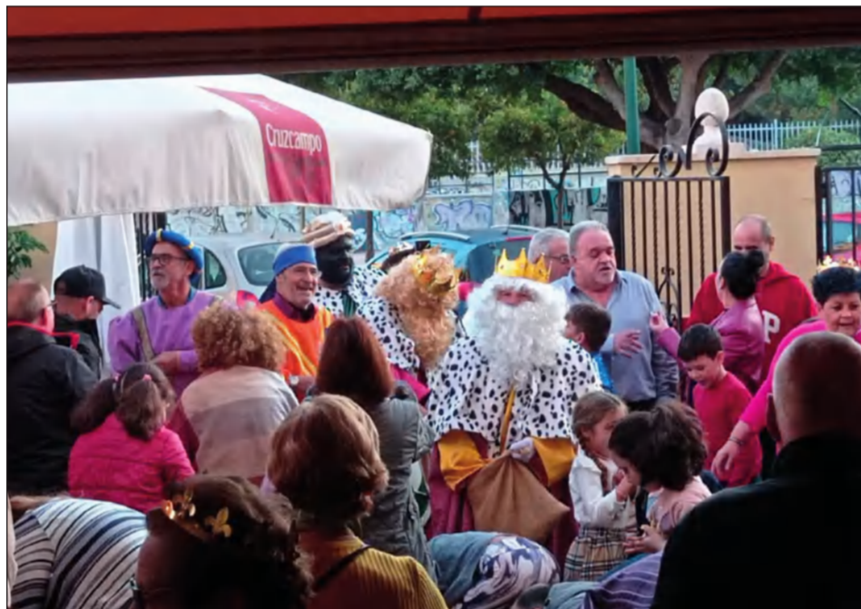
Multitudinario recibimiento de los Reyes Magos en la Casa de Álora Gibralfaro.