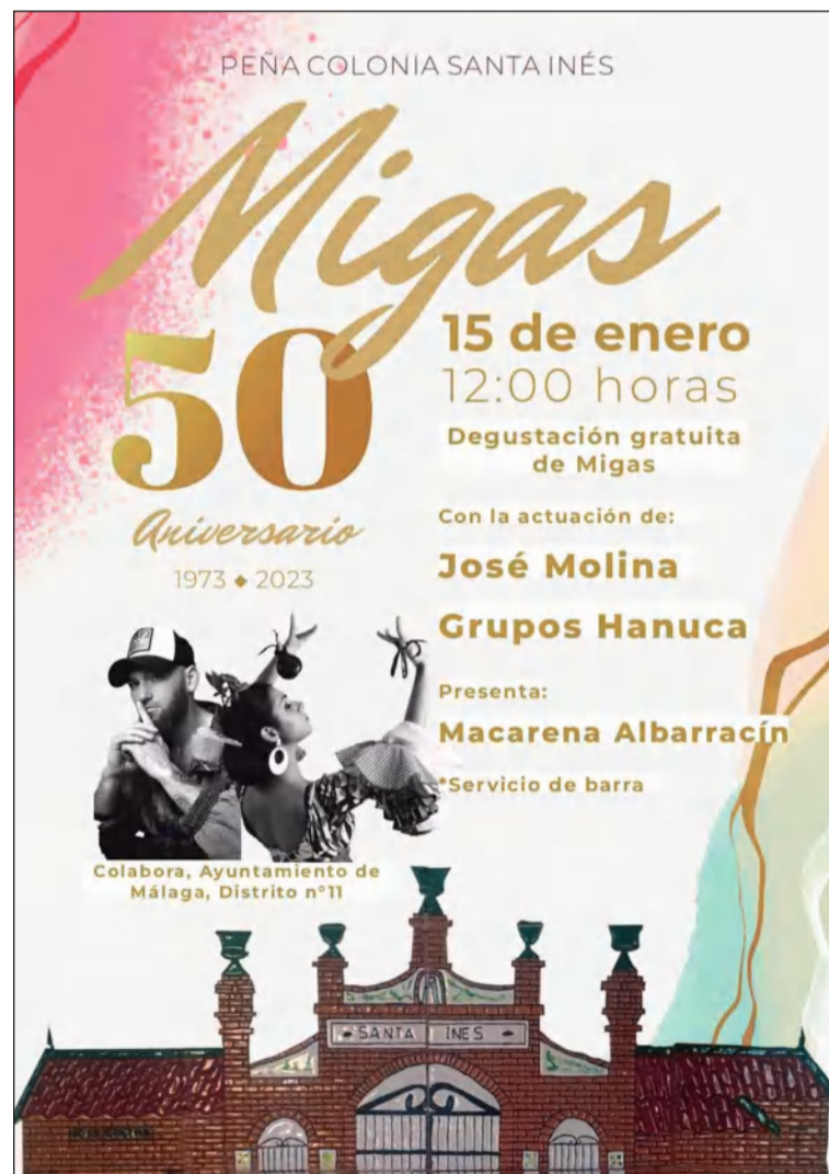
Cartel del 50 Aniversario de las Migas de la Peña Colonia Santa Inés.

Hasta agotar existencias. Ámbito de la promoción Provincia de Málaga. Disponible durante la semana en tu punto de venta.