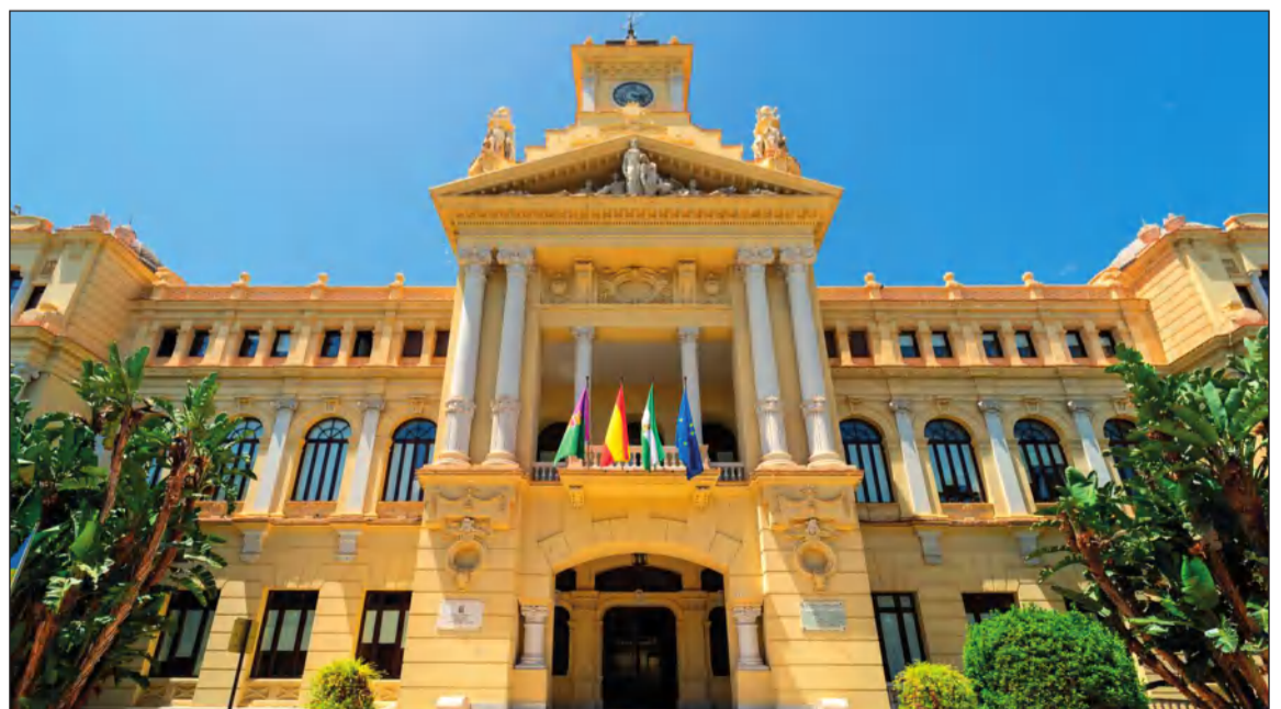
El Ayuntamiento de Málaga ha publicado la convocatoria.

Para colaborar en su tramitación, el personal administrativo de esta Federación se encuentra a disposición de todo el colectivo.