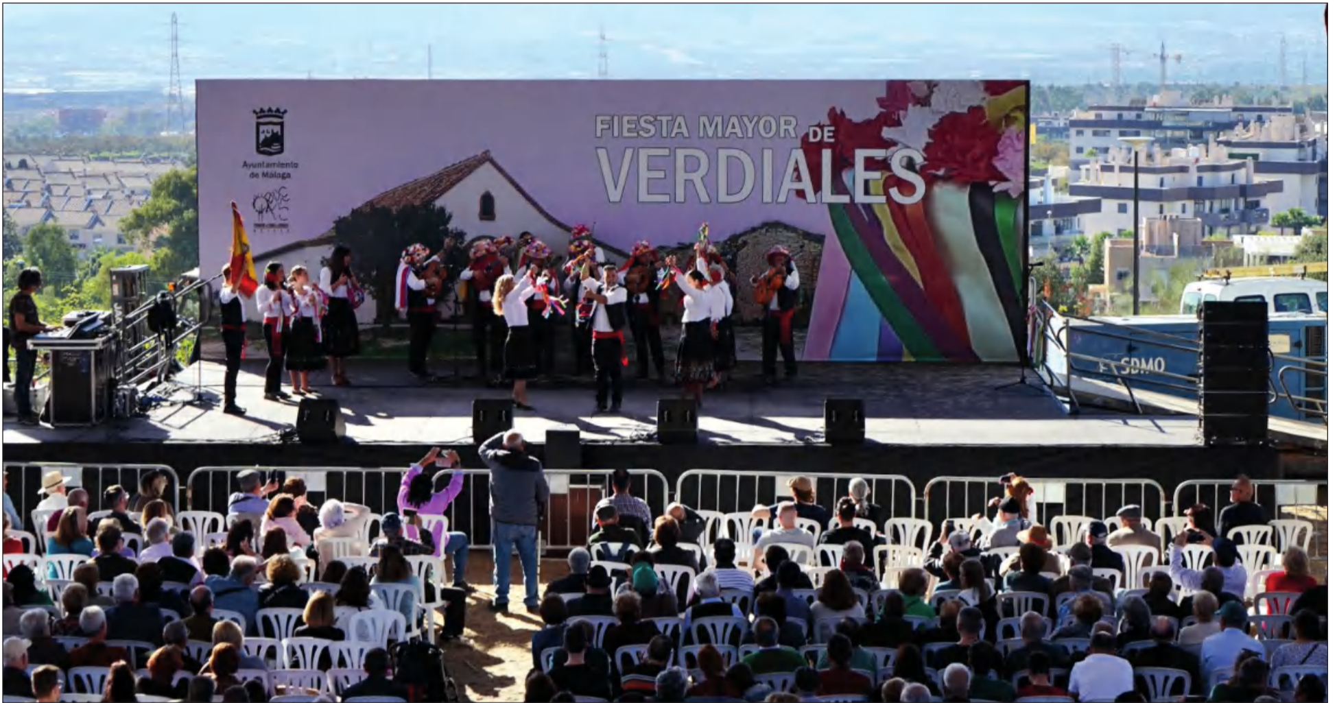
El Parque Andrés Jiménez Díaz de El Puerto de la Torre acogía esta Fiesta Mayor de Verdiales 2022.