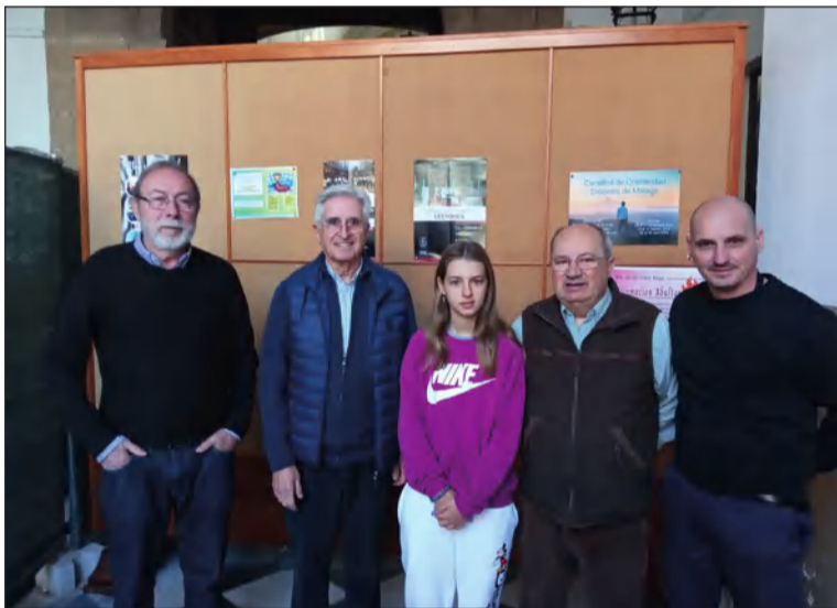
Entrega de la recogida de alimentos a la Parroquia de El Carmen.