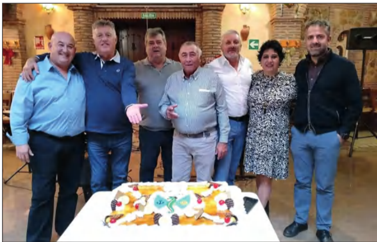
Se cortó la tradicional tarta.

Uno de los momentos más especiales llegaba con el corte de la tradicional tarta, entonando el presidente el cumpleaños feliz por el aniversario de la peña.