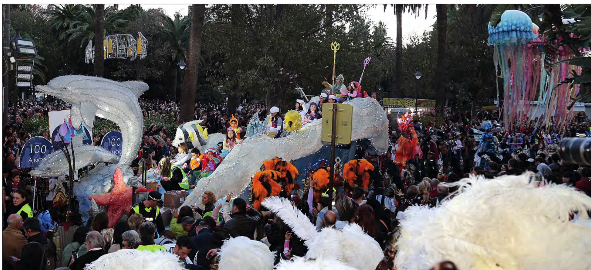
El colectivo peñista fue invitado un año más por el Área de Fiestas del Ayuntamiento de Málaga a participar en el cortejo real.