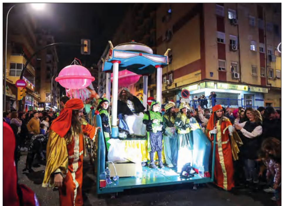
La cabalgata de Bailén Miraflores volvió a destacar por ser una de las más participativas.