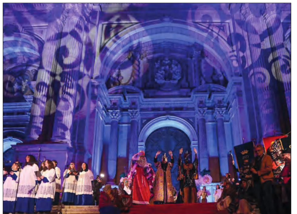
Adoración de los Reyes en la Catedral.