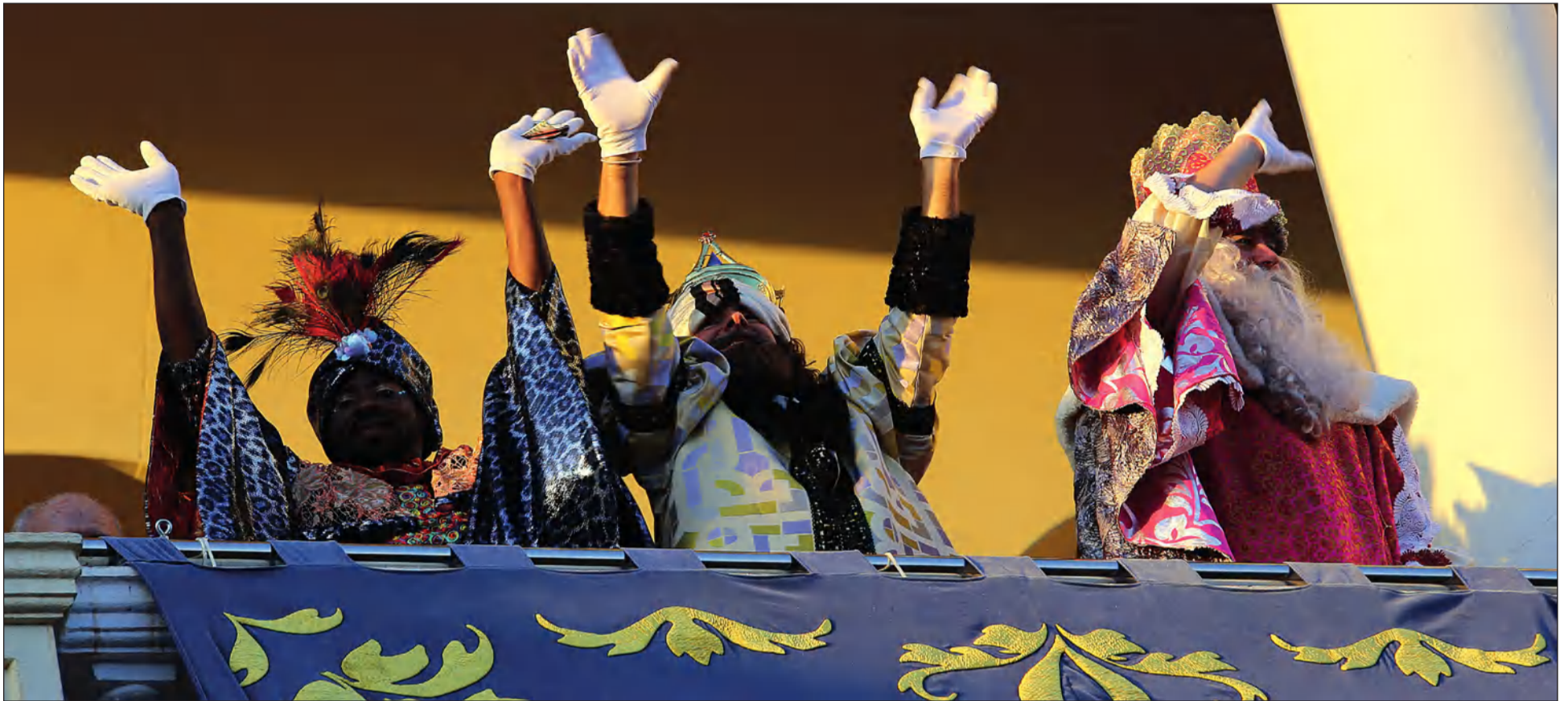
Los Reyes Magos saludan a la Ciudad de Málaga desde el balcón del Ayuntamiento.