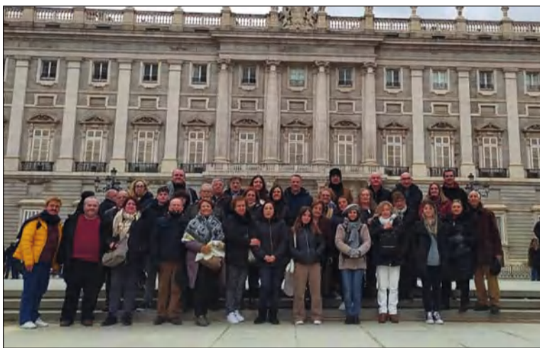
Socios ante el Palacio Real de Madrid.

Uno de los momentos destacados de las celebraciones llegará con su comida de hermandad programada para el domingo 18 de diciembre.