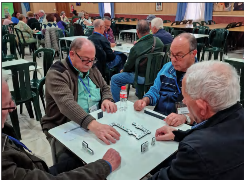
Una de las partidas de dominó disputadas durante todo el fin de semana.