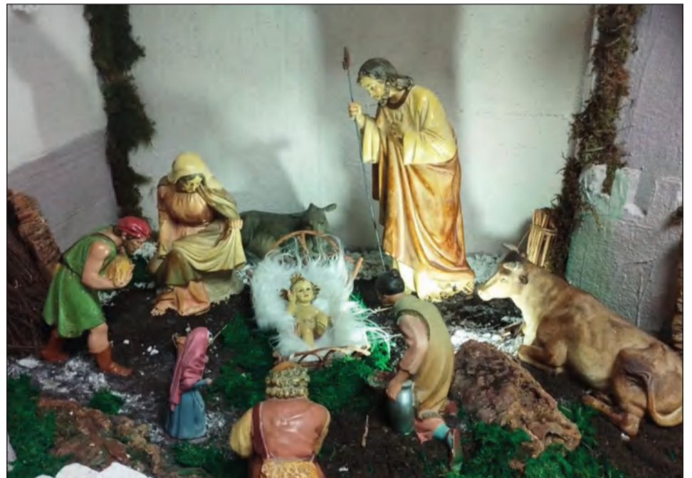
Peña El Sombrero.