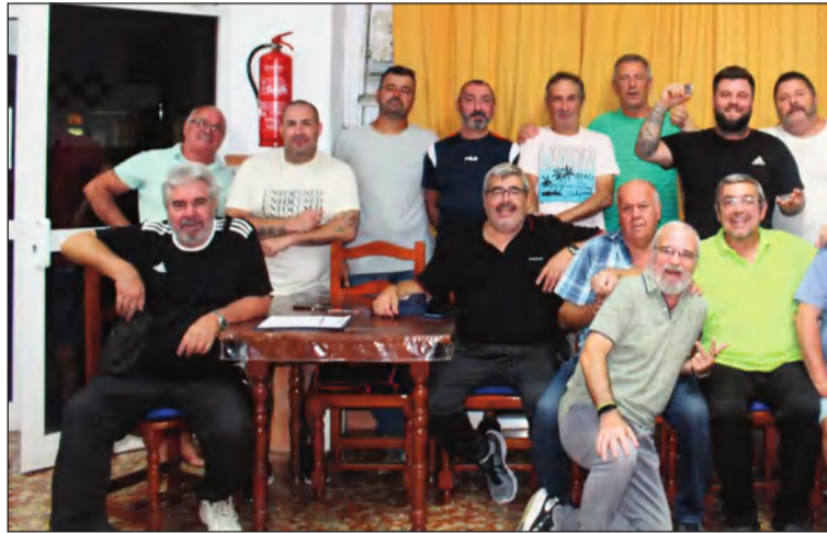
Participantes en el torneo de dominó.