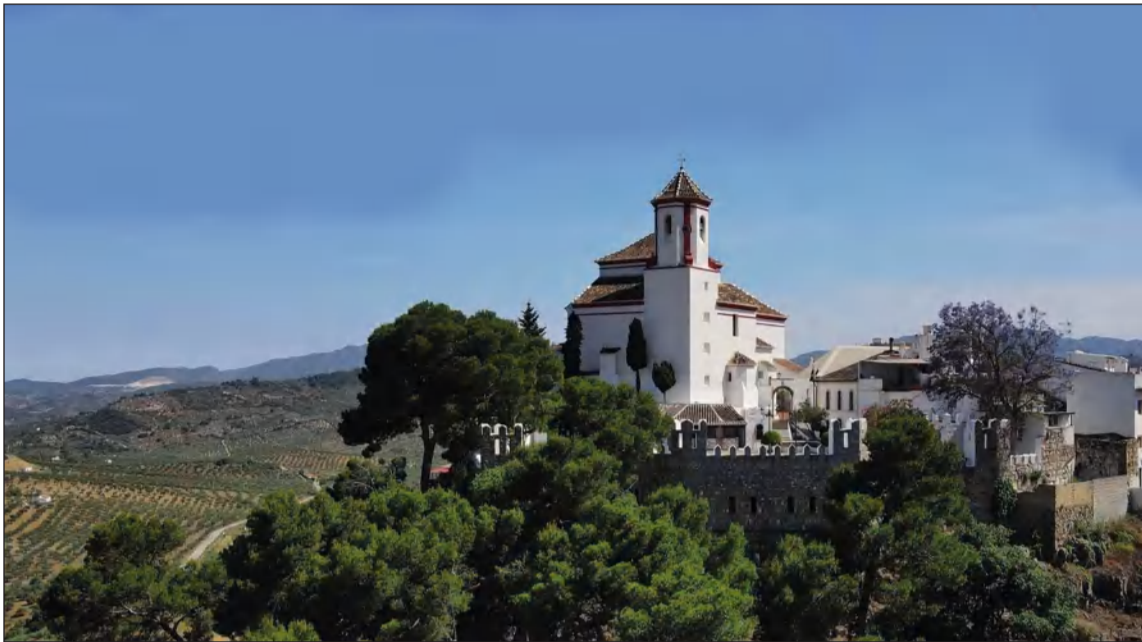
La localidad de Alozaina ha puesto todas las facilidades para acoger este evento.

• FEDERACIÓN MALAGUEÑA DE PEÑAS, CENTROS CULTURALES Y CASAS REGIONALES 'LA ALCAZABA'