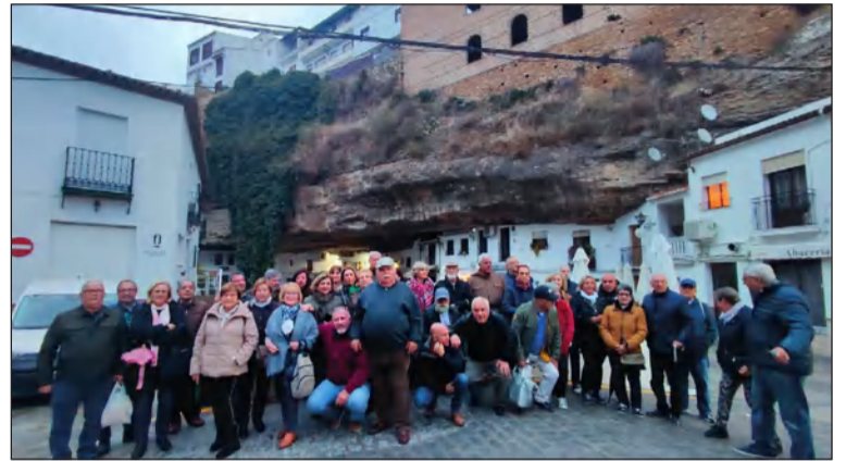
Imagen de grupo durante la excursión a Setenil de las Bodegas.

Los socios de esta entidad perteneciente a la Federación Malagueña de Peñas, Centros Culturales y Casas Regionales 'La Alcazaba' disfrutaron de una agradable jornada de convivencia en estos bellos municipios.