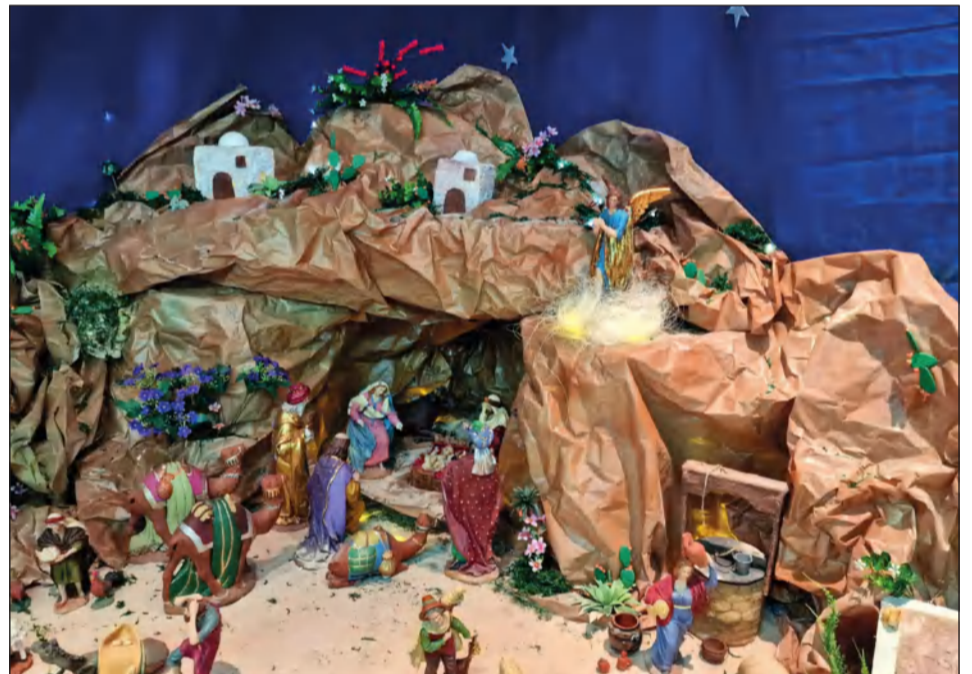
Peña Nueva Málaga.