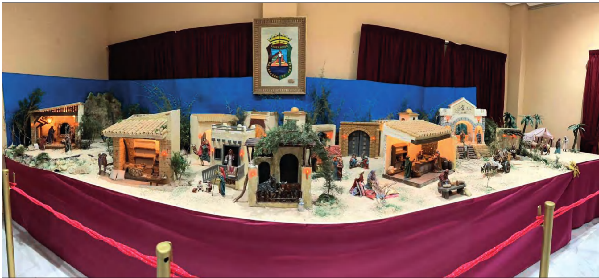
Belén de la Federación Malagueña de Peñas en la Sala FEMAPE - La Alcazaba, con acceso por la calle Victoria.