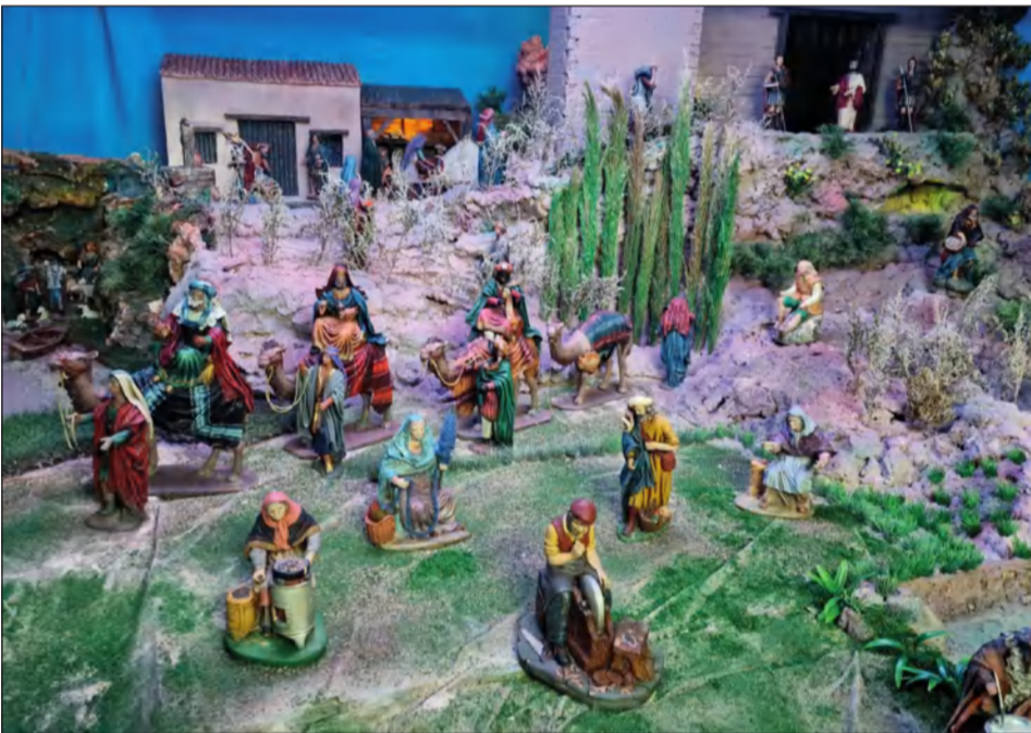
Peña Los Rosales.