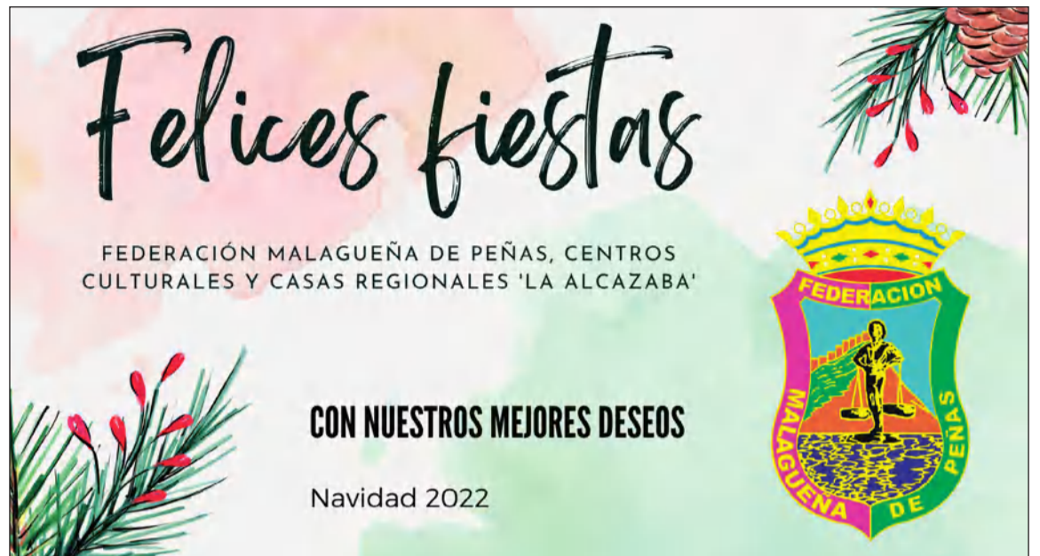
Felicitación Navideña de la Federación Malagueña de Peñas.

Antes de que acabe el año volveremos para desearles un Feliz 2023.