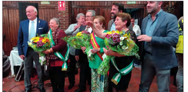
Momento simpático de la elección de la Reina y sus Damas.

En el transcurso de este entrañable acto se nombraba a la Reina y Damas de la peña entre sus socias.