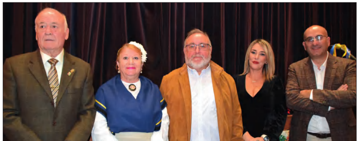
Autoridades municipales y provinciales acompañaron a los miembros de la entidad federada.