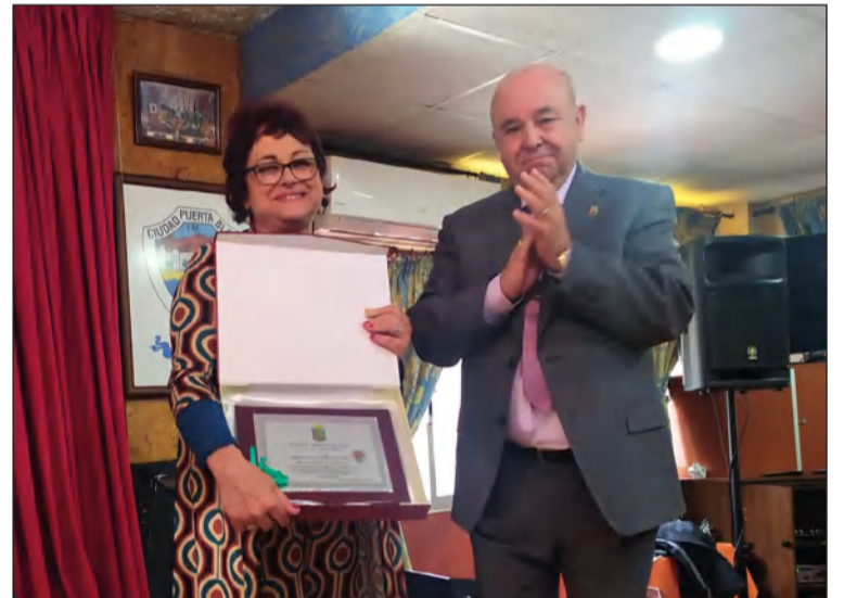
La Federación hacía entrega de una placa conmemorativa a la entidad.