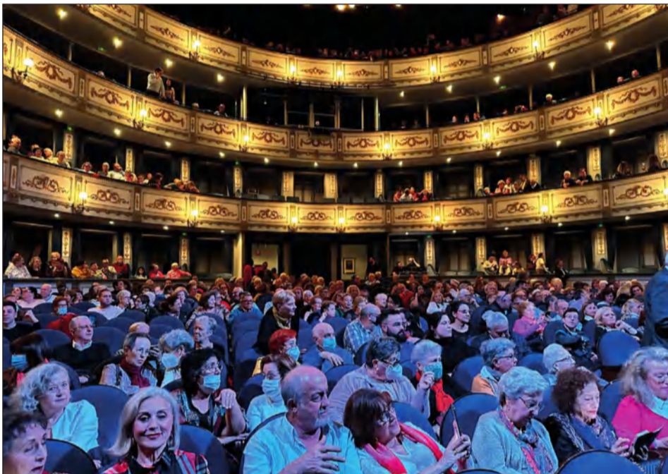
Lleno total en el Teatro Cervantes para vivir Málaga Cantaora 2022.