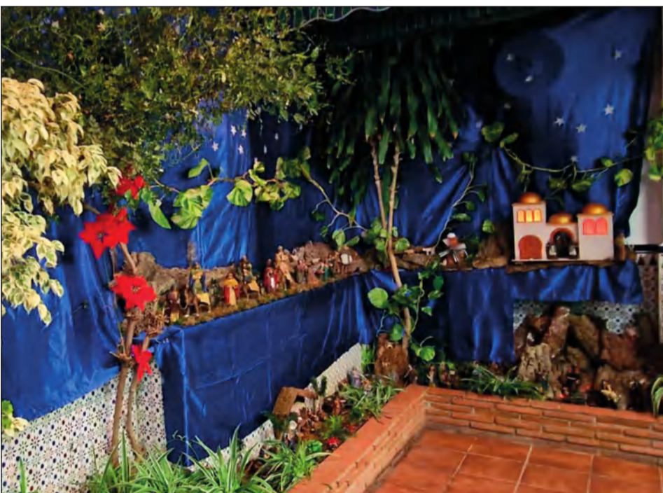
Agrupación Cultural Telefónica.