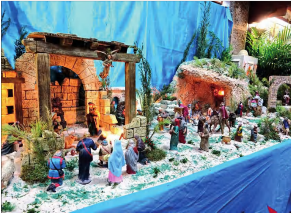
Peña El Palustre.

todos los malagueños. La entrega de los premios tendrá lugar el domingo 18 de diciembre, coincidiendo con el Encuentro de Pastorales en el Teatro Cervantes.