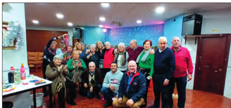
Socios durante la inauguración del Belén de la Peña Cruz de Mayo.