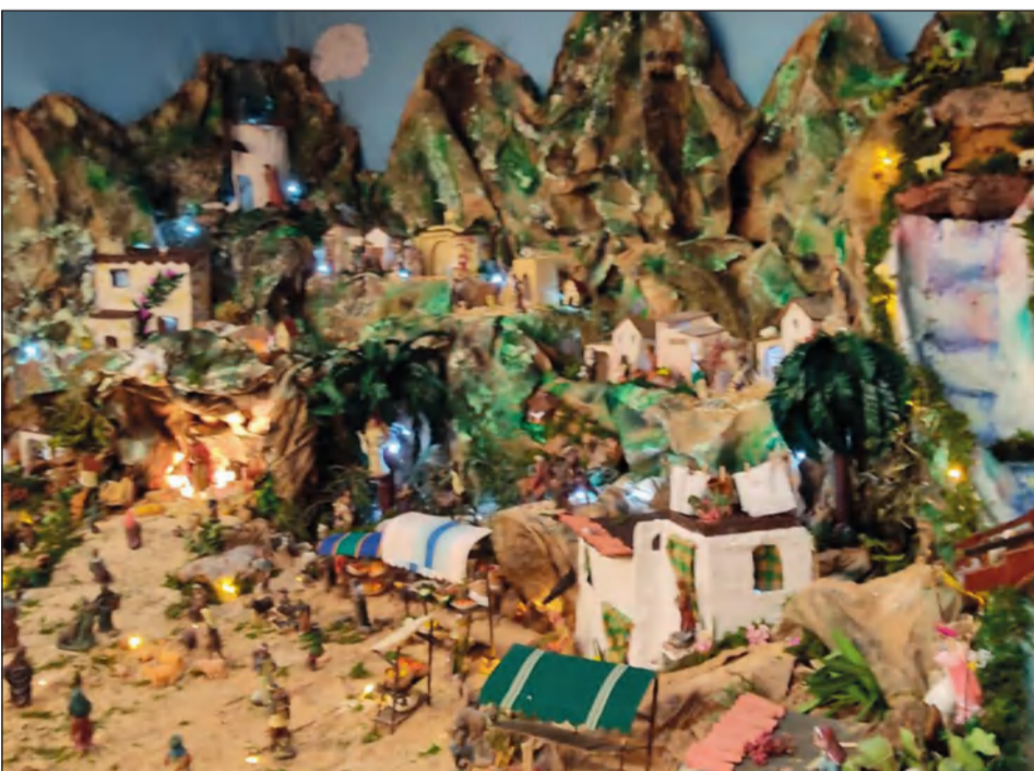
Peña Tiro Pichón.