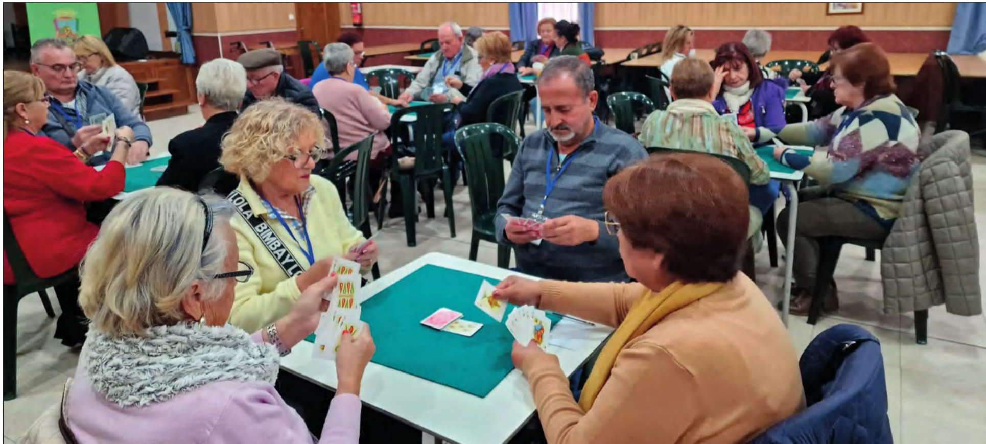
Vista de la sala de la Casa de Álora Gibralfaro durante la disputa de las partidas de chinchón.

• FEDERACIÓN MALAGUEÑA DE PEÑAS, CENTROS CULTURALES Y CASAS REGIONALES 'LA ALCAZABA'