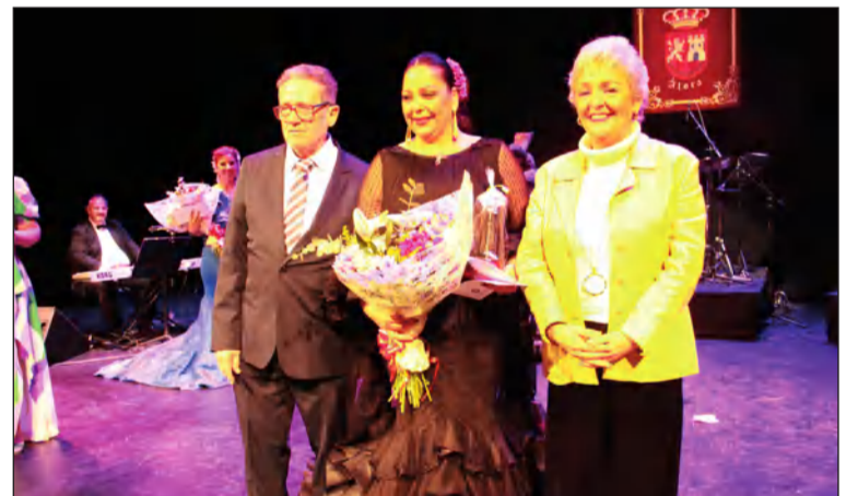
Entrega del premio a la ganadora.