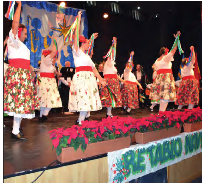
Imagen de la representación.