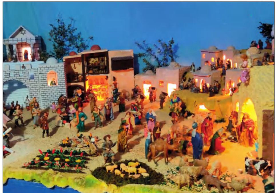
Peña Costa del Sol.