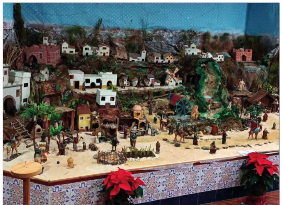
Peña Cruz de Mayo.