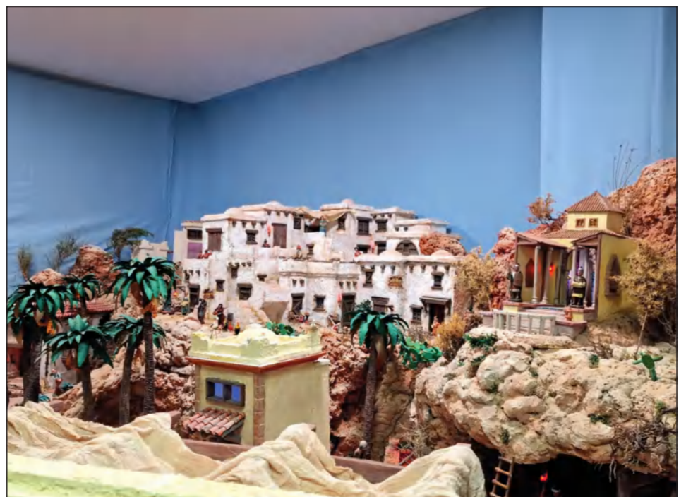
Asociación de Vecinos Finca La Palma Hanuca.