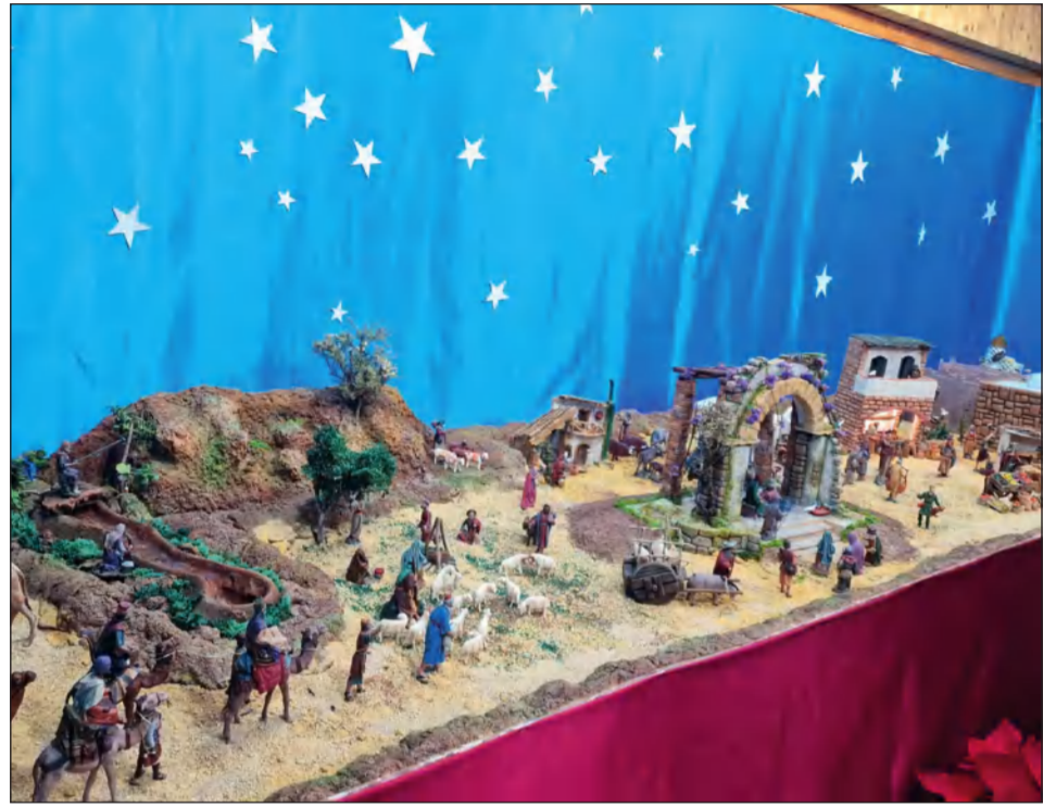
Casa de Melilla en Málaga.