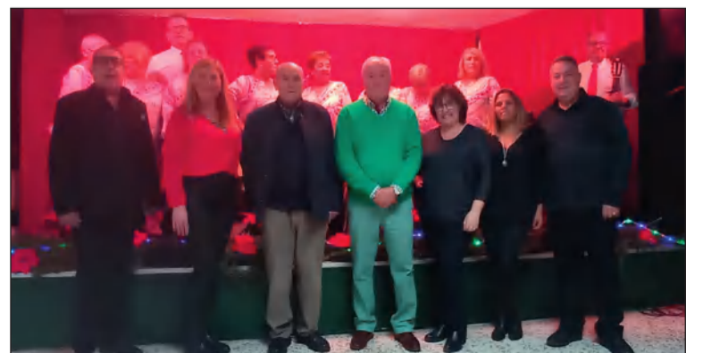
Acto celebrado el pasado fin de semana.

Los socios de la Asociación de Vecinos de Puerta Blanca eran convocados para disfrutar de villancicos para anunciar la llegada de la Navidad.