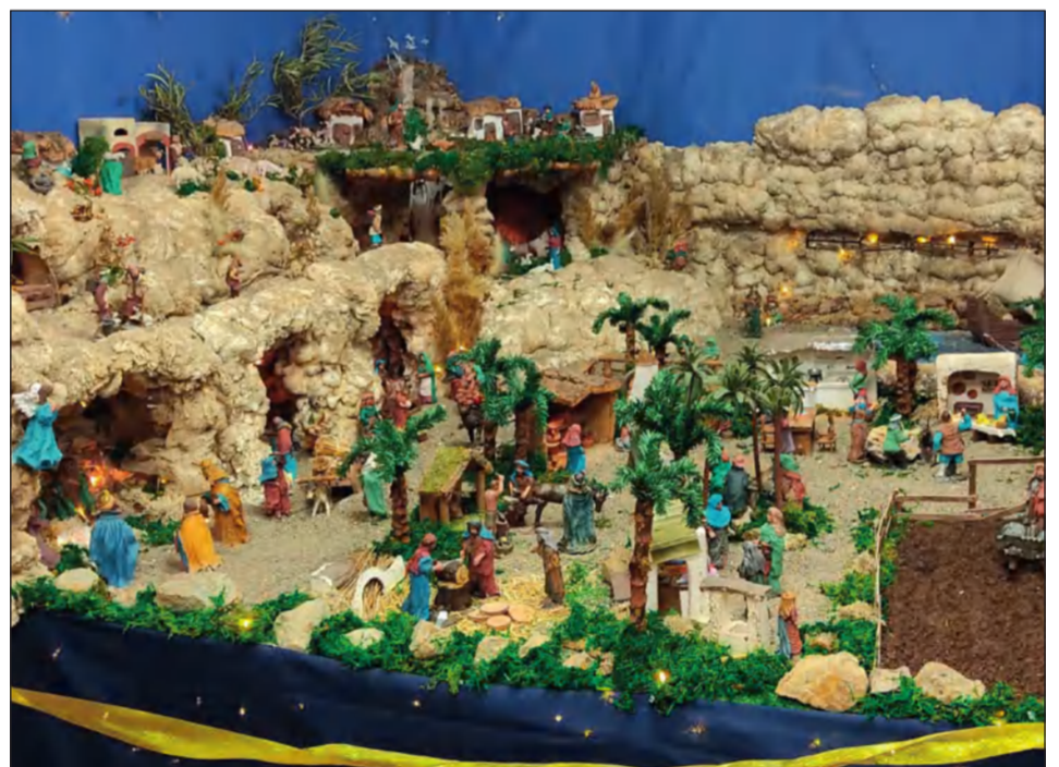
Peña Colonia Santa Inés.