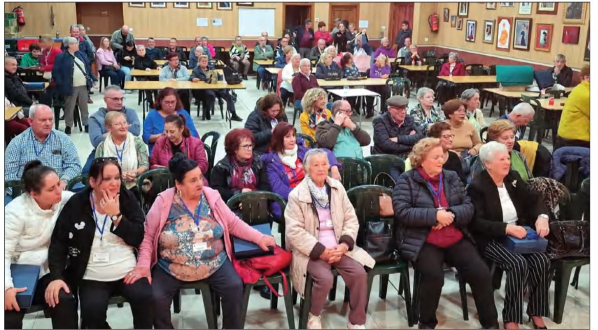
Acto de entrega de trofeos en la tarde del domingo 4 de diciembre.