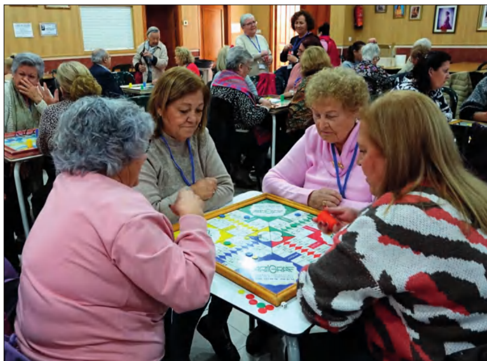
El parchís contó con una gran participación en estas Olimpiadas de Juegos de Peñas.