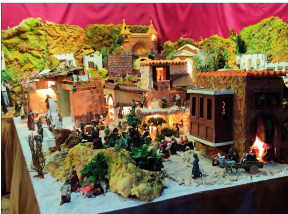
Asociación de Vecinos Victoriana de Capuchinos y de la Fuente.