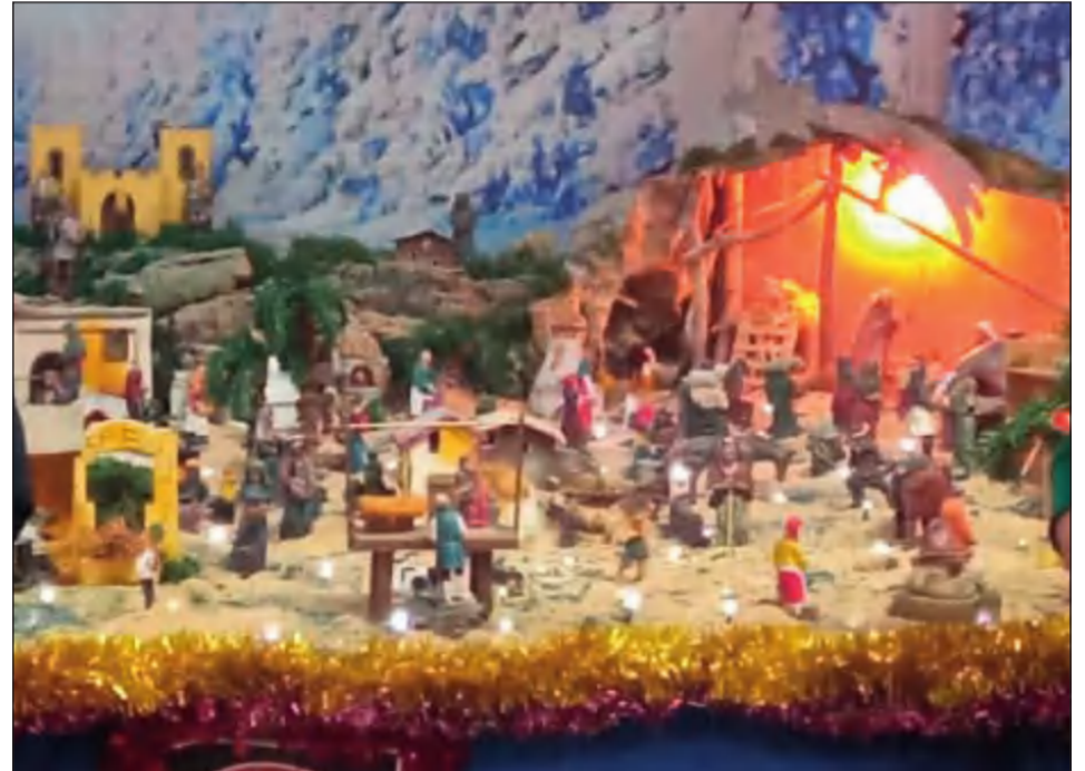
Peña San Vicente.