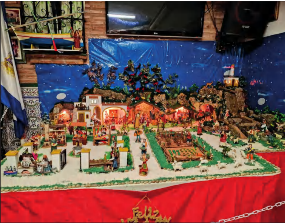
Peña Los Bolaos.