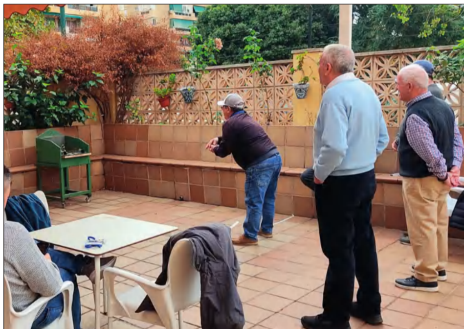
El lanzamiento a la rana se desarrolló en el exterior de la entidad.