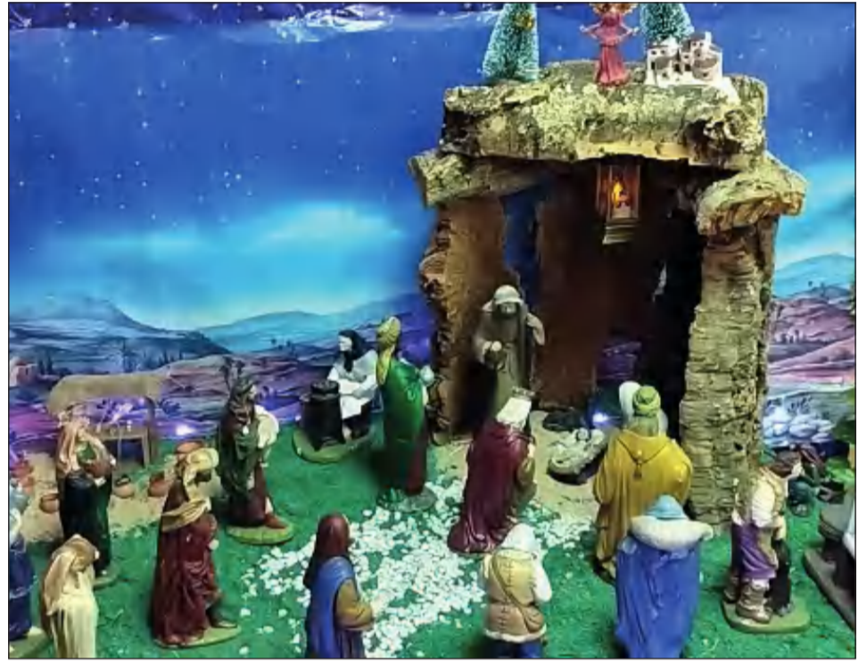
Peña Montesol Las Barrancas.