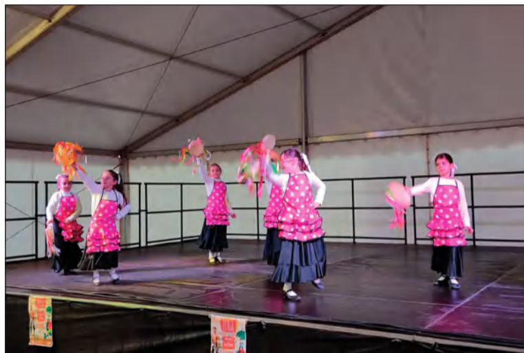
Componentes de los grupos de baile de la asociación.