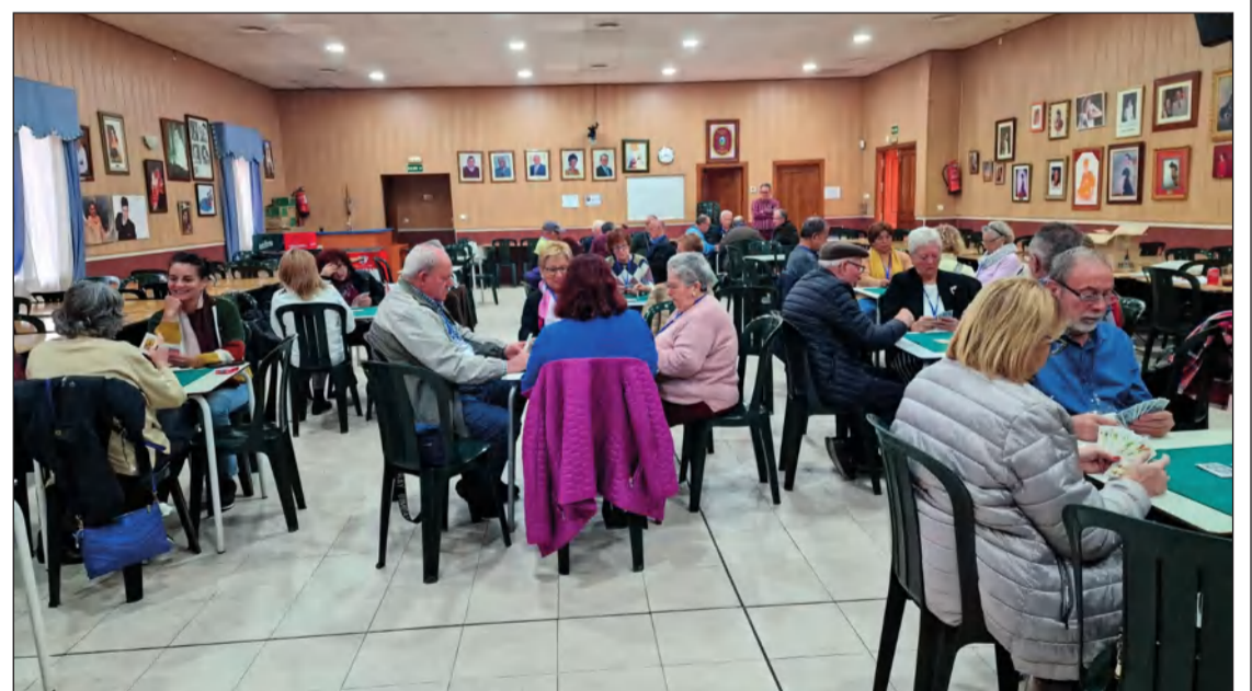
La competición, organizada por la Federación Malagueña de Peñas, tenía lugar en la Casa de Alora Gibralfaro.