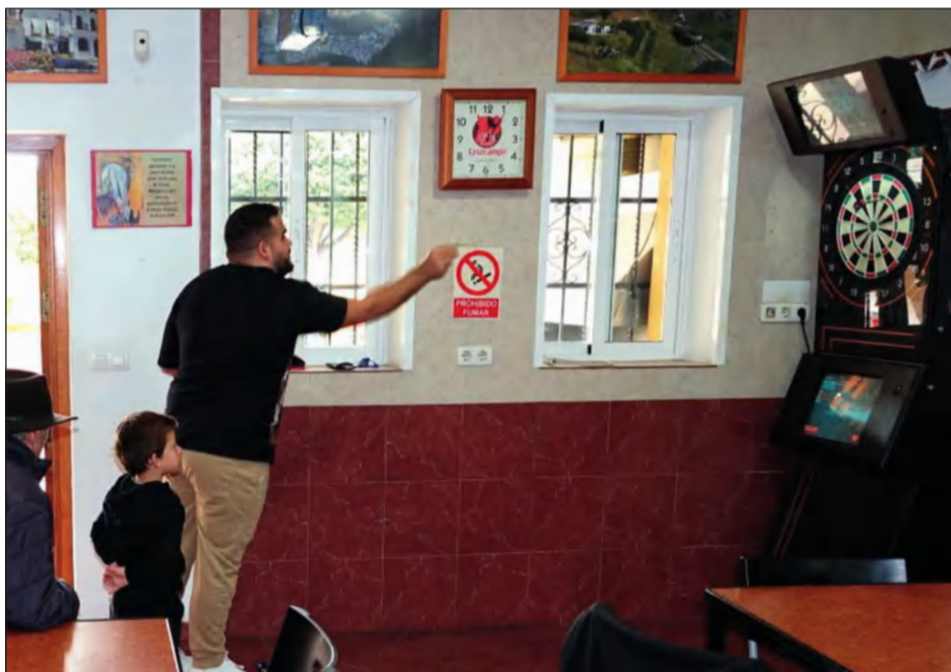
Competición de dardos.