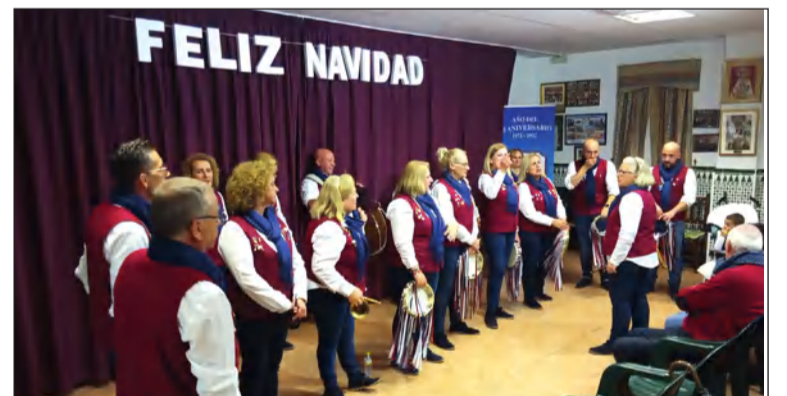
Intervención de la Pastoral de la Peña Santa Cristina.

Las pastorales de las Peñas Montesol Las Barrancas y Santa Cristina han ofrecido sus villancicos en la sede de la Peña Perchelera.