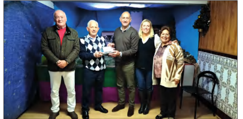
Inauguración y bendición del Belén de la Peña Los Rosales.

Como colofón, se contó con una gran actuación a cargo del Coro Los Claveles, y la intervención del presidente.