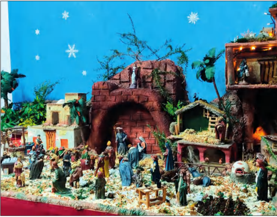
Peña Santa Cristina.