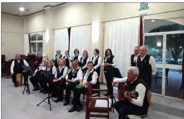
Actuación del Coro Agua Marina en una residencia de ancianos.