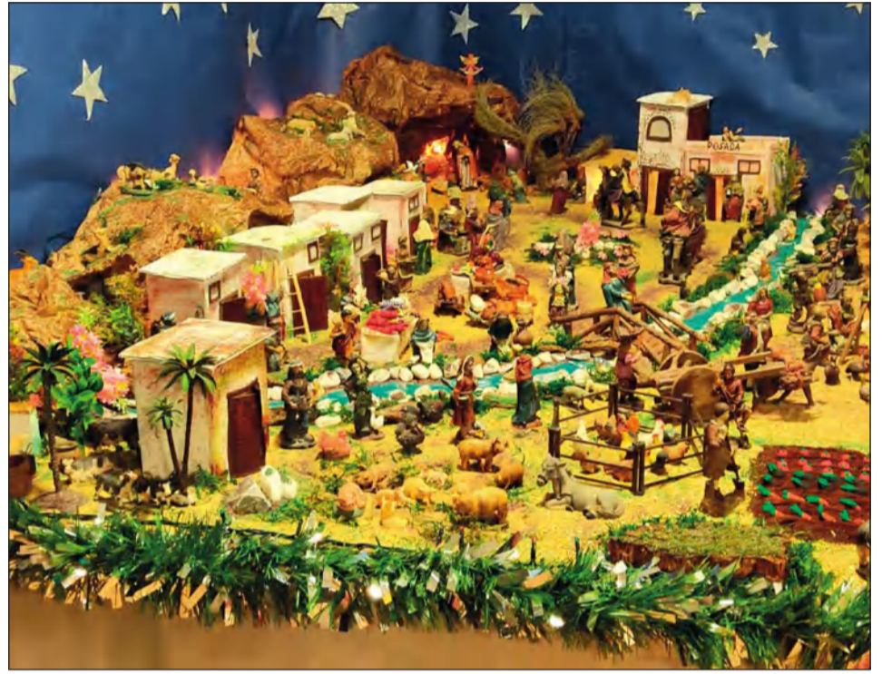
Peña Cortijo de Torre.