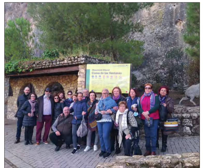
Socios en el exterior de la Cueva de las Ventanas.