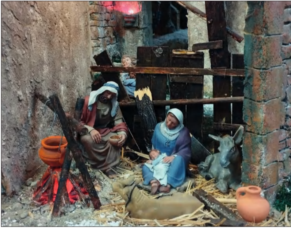
Peña La Biznaga.