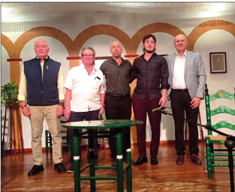
Sesión en la Casa de Álora Gibralfaro.