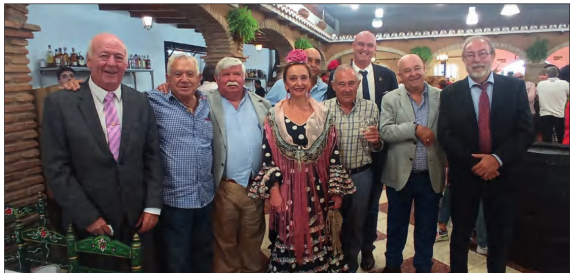
En una de las casetas peñistas visitadas en Fuengirola.

Hay cosas que son exclusivamente malagueñas