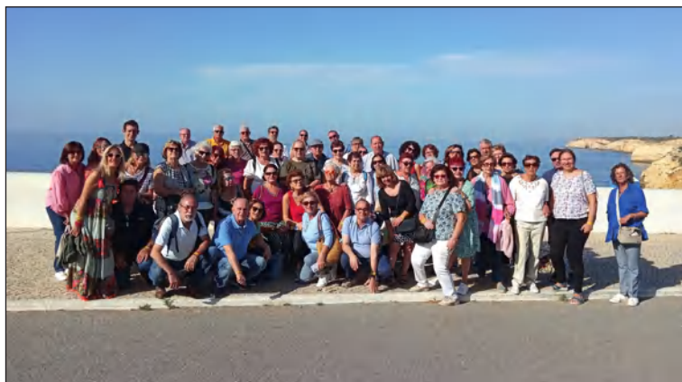
Socios de la Peña Perchelera en el Algarve.