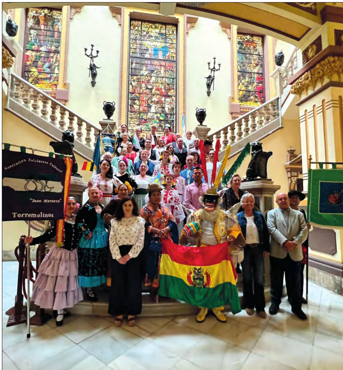
El Festival Internacional de Folclore de Málaga se celebrará del 26 al 29 de octubre en el Auditorio Eduardo Ocón, con el patrocinio de la Fundación Unicaja y la colaboración del Ayuntamiento.

Web: www.femape.com Edición digital: www.femape.com/laalcazabadigital Twitter: @FMPLaAlcazaba Facebook: FMPLaAlcazaba