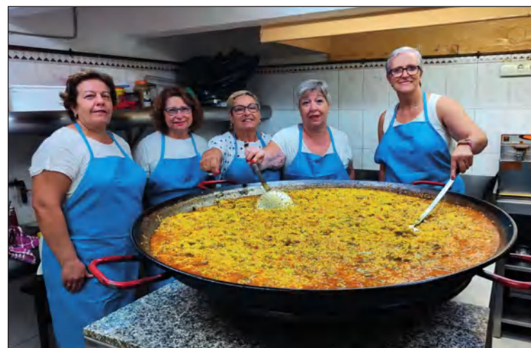
Encargadas de preparar la comida en la Peña El Palustre.

Como cada segundo sábado de mes, la Peña El Palustre celebraba su tradicional Comida de Mujeres con una gran afluencia de socios y señoras de los mismos en la sede de la entidad.