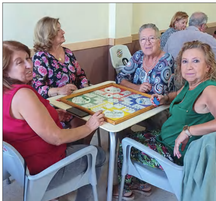
Disputa de las partidas en la Peña Santa Cristina.

Con tal motivo, se ha diseñado un menú especial que estará acompañado de barra libre y una actuación musical para que todos los socios y simpatizantes de la peña puedan conmemorar juntos esta importante actividad.