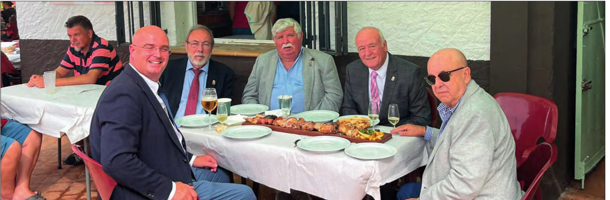
La Federación Malagueña de Peñas ha querido agradecer el gran recibimiento de la Federación de Peñas de Fuengirola en su Feria dell Rosario 2022.