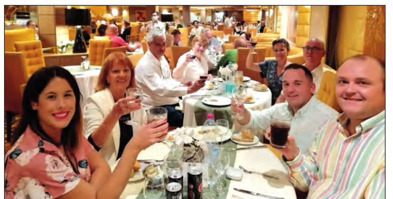
Algunos de los participantes en este crucero.

Además, siguen comenzando sus talleres, en este caso arrancando la nueva temporada del taller de Memoria, Sevillanas, Pintura al Óleo y Arte Floral.