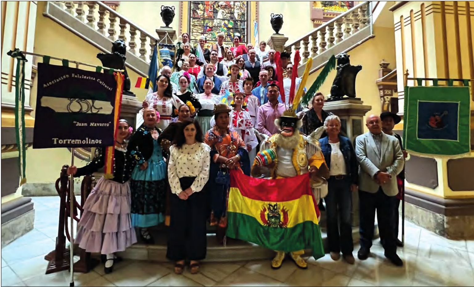
Presentación del festival, con la presencia de representantes de algunos de los grupos participantes en el Festival.