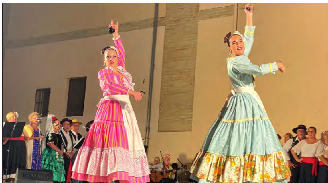
Actuación en el Festival celebrado en la localidad valenciana.