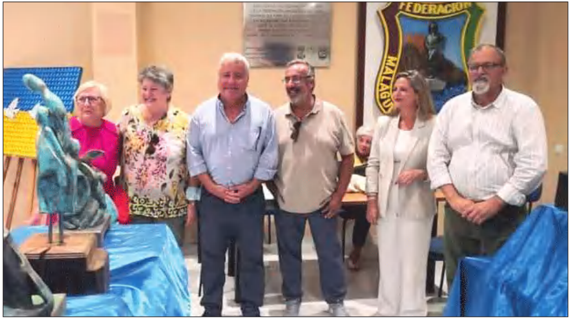
Algunos de los asistentes a la inauguración de la exposición.