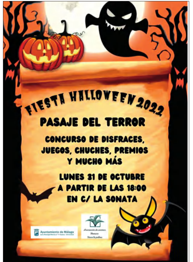
Fiesta de Halloween de la Asociación de Vecinos Hanuca.