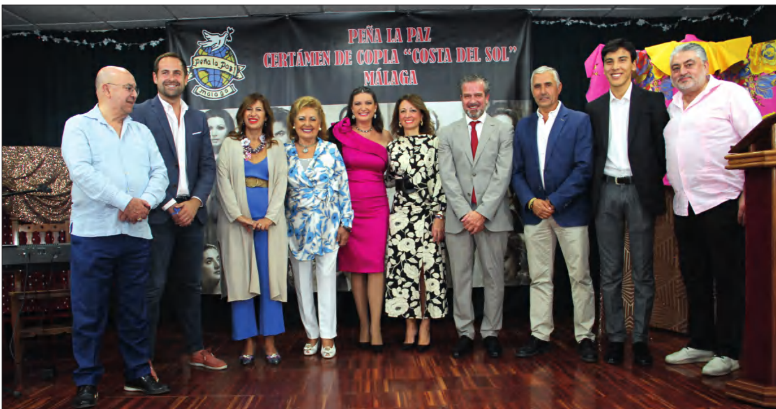
Imagen del acto celebrado en la sede de la Peña La Paz.