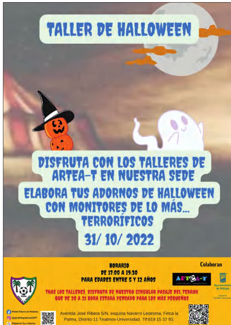
Cartel de los Talleres de Halloween.

No faltará tampoco su Pasaje del Terror, que en su quinta edición, cuenta con horario específico para niños y para adultos.