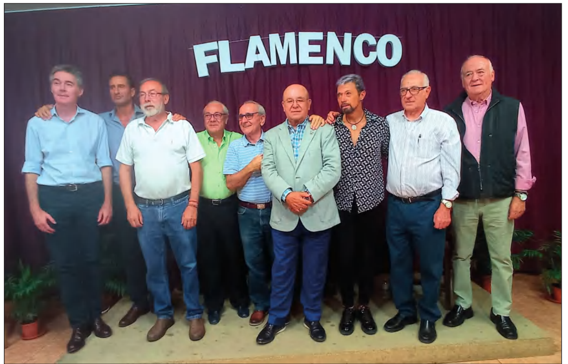
Asistentes a la sesión celebrada en la sede de la Peña Perchelera.