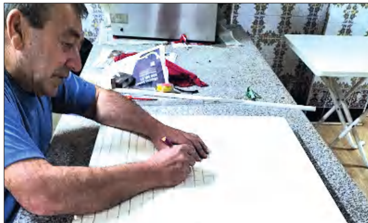
Imagen del taller de la Peña Los Rosales.

La Peña Los Rosales está acogiendo en su sede social un taller de Belenes en para todos sus socios y vecinos de la barriada de Miraflores de los Ángeles.