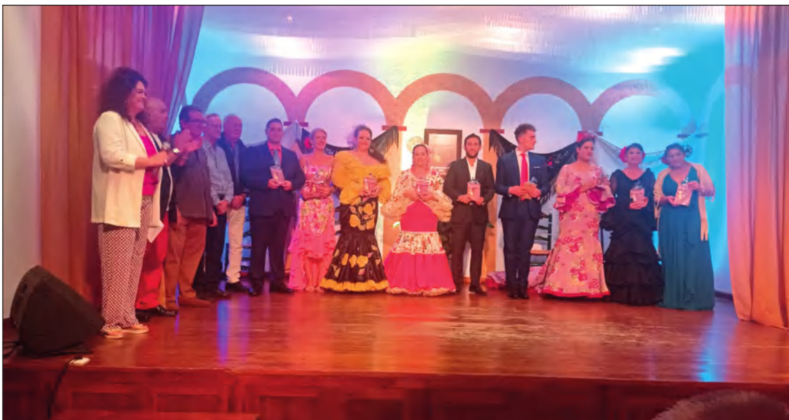
Participantes en la primera semifinal del Certamen de Canción Española.

La Casa de Álora Gibralfaro arranca el próximo 15 de octubre su XXX Certamen de Canción Española 'Noche de Coplas Memorial Juan Luis Molina Grano', comenzando así una primera fase que se disputa los días 22, 28 y 29 de octubre en su