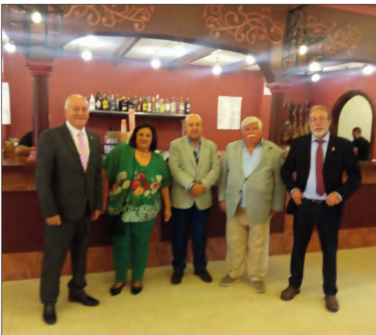
Con la presidenta de la Peña Juannito y secretaria de la Federación.