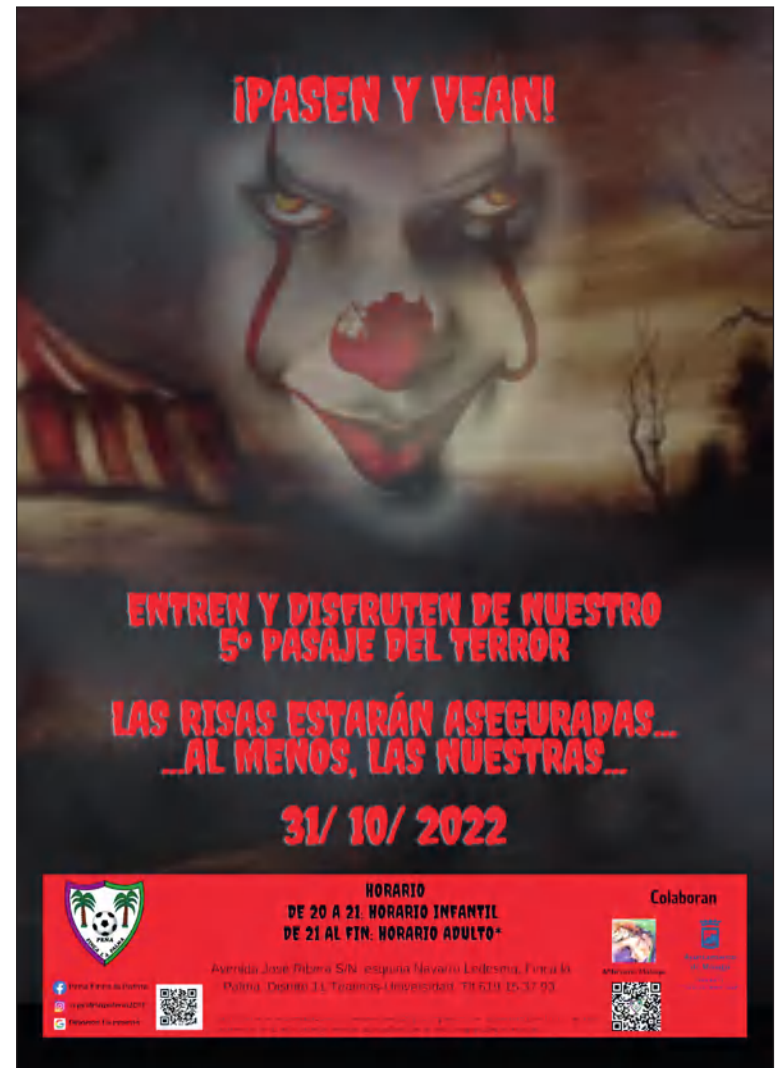
Cartel del Pasaje del Terror.