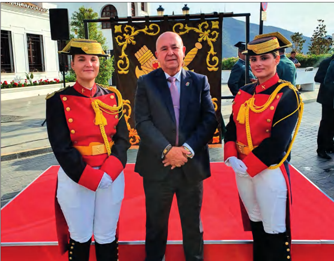
La Federación Malagueña de Peñas fue invitada a participar en este acto.