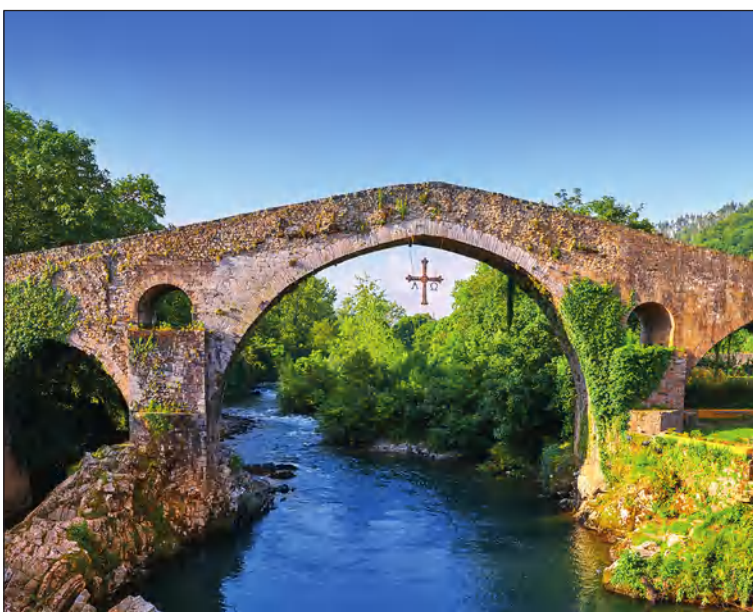
Puente romano de Cangas de Onís.