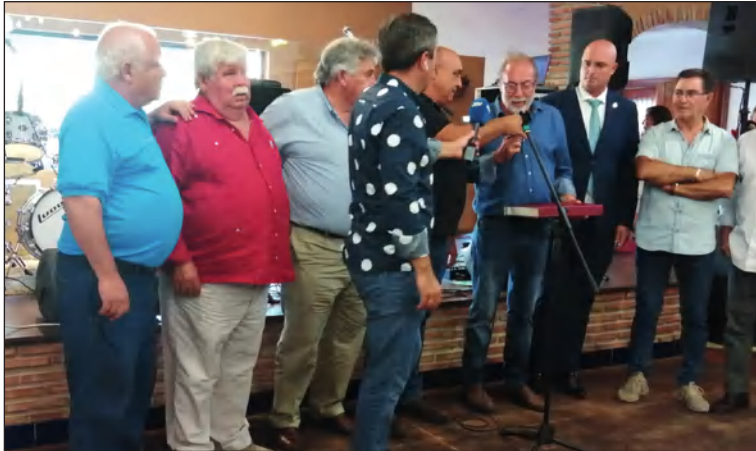
Entrega de una placa a la Peña de Fuengirola por su 50 Aniversario.

Unos días antes, la Peña Perchelera organizaba un viaje al Algarve (Portugal), que como todas sus propuestas contó con un gran respaldo de socios y simpatizantes que completaron las plazas disponibles.