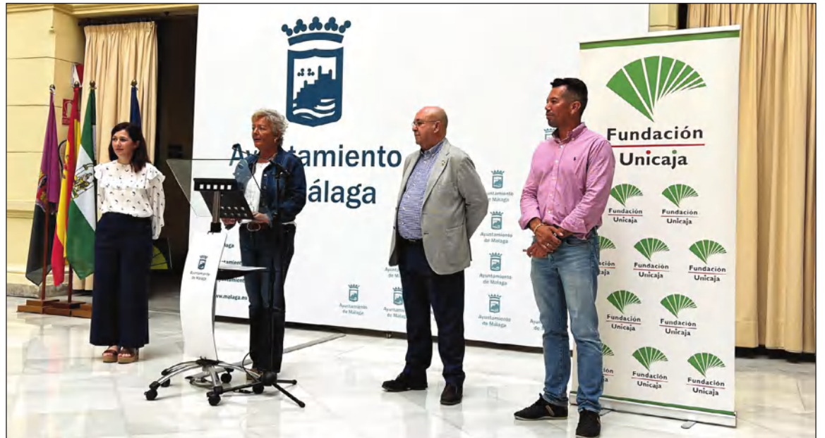
Acto de presentación del Festival Internacional de Folclore de Málaga (FIFMA 2022).

Desde aquí, invitamos a todos los malagueños a disfrutar de este gran acontecimiento en un lugar único como es el Parque, donde por cuatro días se reúne el folclore del mundo.